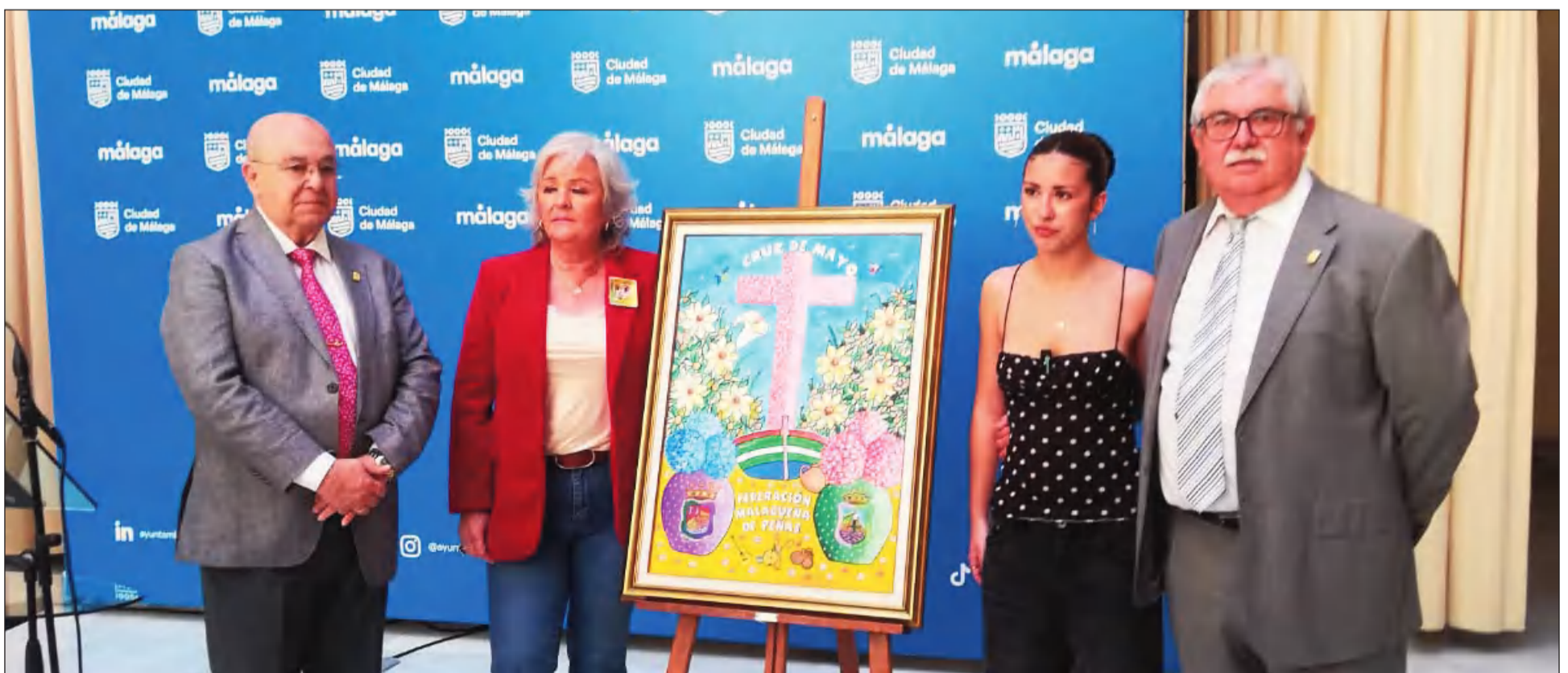
Acto de presentación del cartel de la Fiesta de la Cruz de Mayo 2025, celebrada también en el Patio de Banderas del Ayuntamiento.