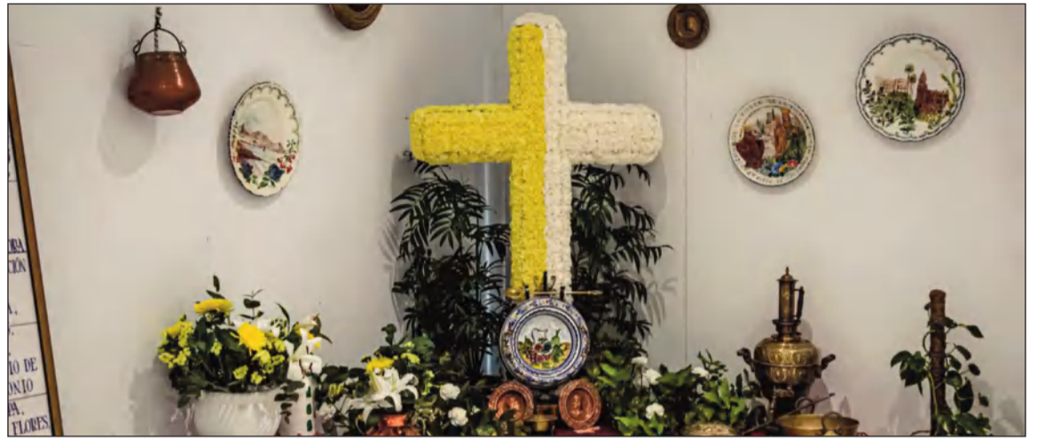
Cruz de Mayo que el año pasado instaló la Federación.

Con eso, las Cruces completarán todo su mes. El mes de Mayo que se nos avecina.