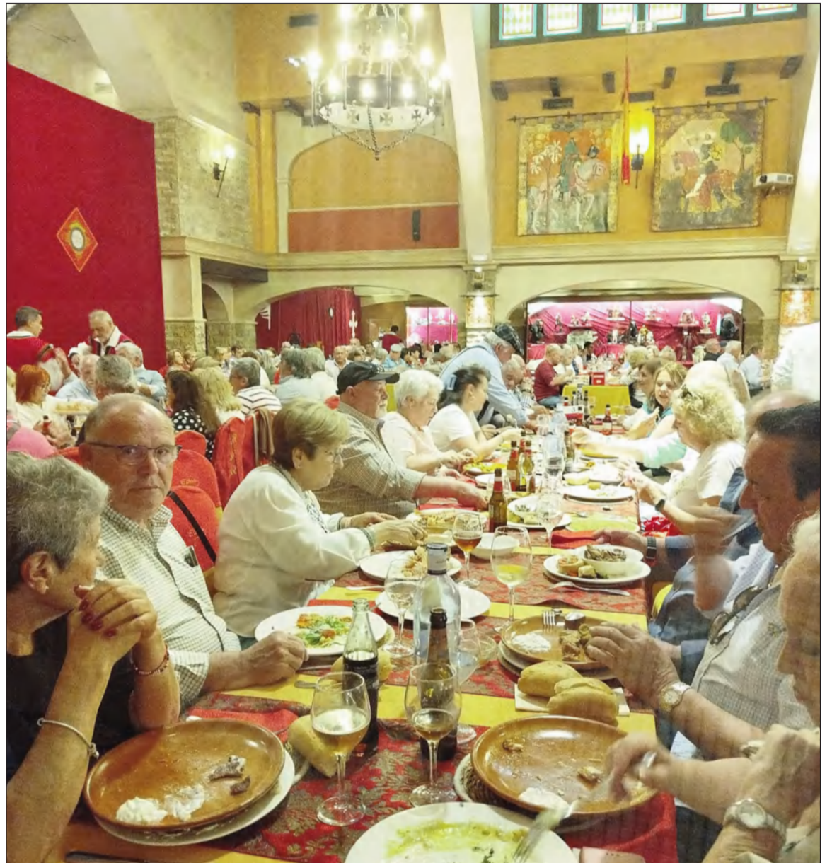
Vista general del Restaurante El Artista de Montemayor, donde almorzaron los peñistas.

A su finalización se procedía al regreso a Málaga, con paradas en los mismo puntos de salida después de una jornada inolvidable.