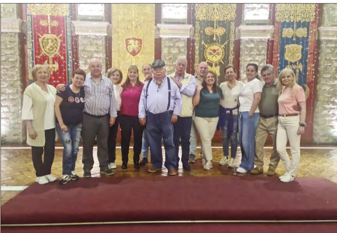
Los peñistas disfrutaron de un espectáculo musical.