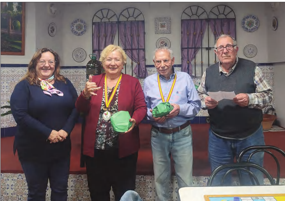
Acto de entrega de trofeos a la finalización del torneo.

grantes de esta entidad perteneciente a la Federación Malagueña de Peñas, Centros Culturales y Casas Regionales 'La Alcazaba'.