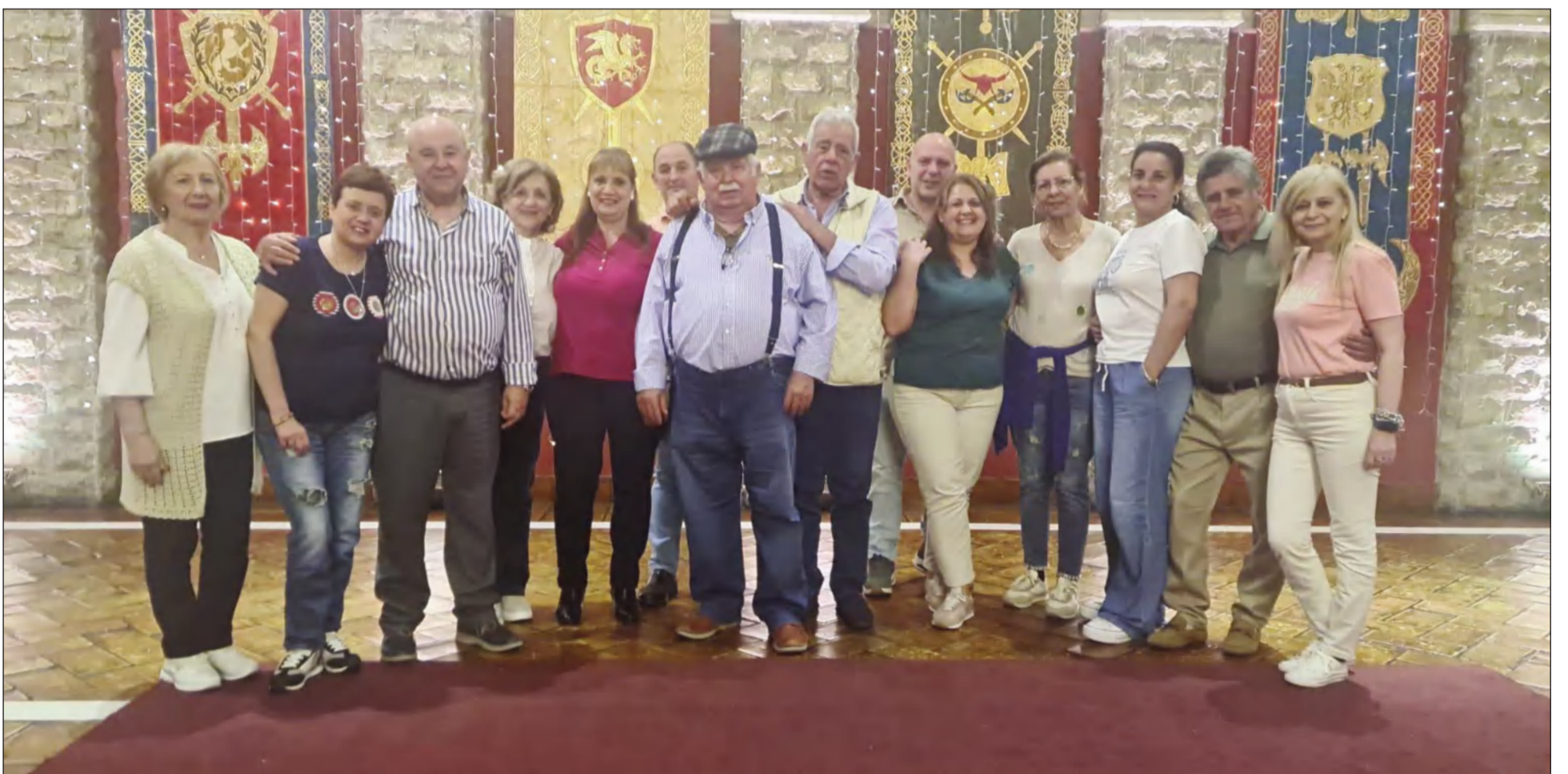
Representantes de la Federación que asistieron a esta actividad en Montemayor.