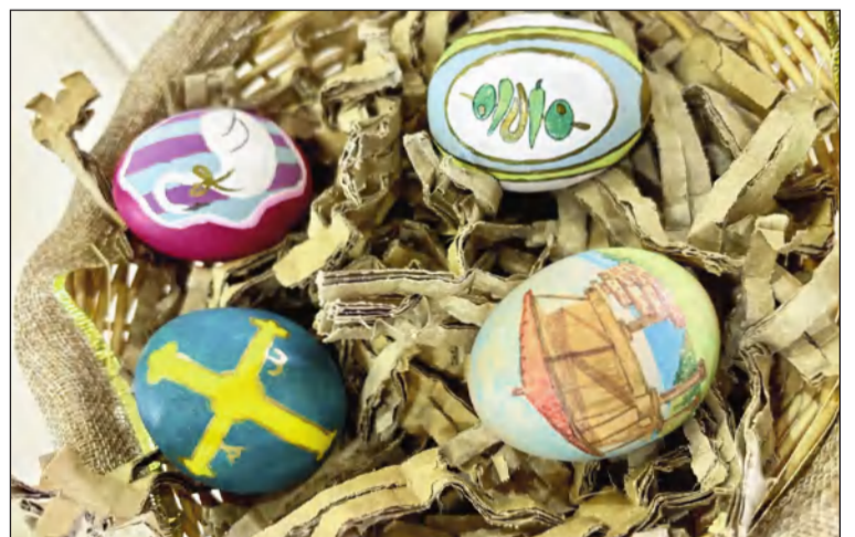
Algunos de los huevos pintados.

Se establecía una categoría infantil y otra para adultos, con muchos premios para los participantes y una merienda para finalizar.