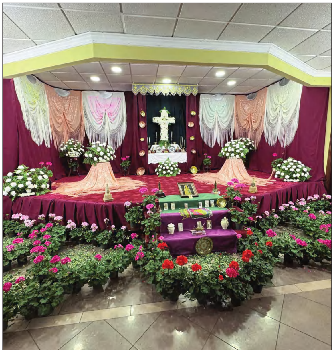
Cruz de Mayo de la Peña La Paz, primer premio del Certamen de 2025.

NOTA: La organización se reserva el derecho de modificar cualquier punto, en interés de dicho Certamen.