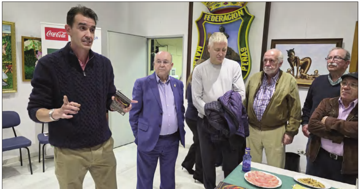
Presentación de 'España Fantasía Sinfónica' a los peñistas, con la presencia del director Yuri Chugúyev.

Esta cita imprescindible no solo celebra nuestra música, sino que proyecta la esencia de Málaga al mundo. Para aquellos que deseen vivir esta experiencia única, donde la tradición se abraza con la vanguardia tecnológica, la información sobre entradas y próximas fechas en nuestra provincia está disponible en la web oficial spainshow.es. Una oportunidad de oro para sentir el orgullo de nuestra herencia cultural en un formato jamás visto.