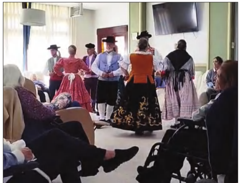
Exhibición de bailes ante los mayores.