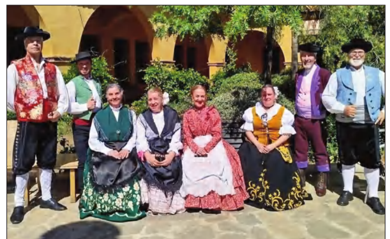
Componentes de la asociación en los jardines de la residencia.

Con actividades como esta, desde esta entidad perteneciente a la Federación Malagueña de Peñas, Centros Culturales y Casas Regionales 'La Alcazaba' se siguen tejiendo vínculos que honran nuestras raíces y celebran la riqueza humana que nos define.