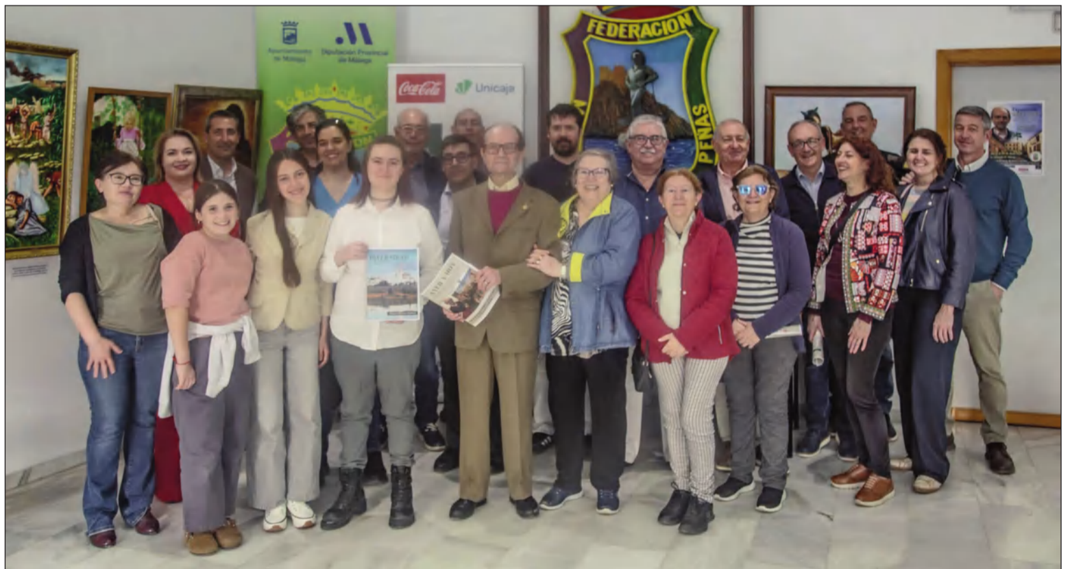
Acto de inauguración de la exposición.

mia Malagueña de las Artes y las Letras y contó con la asistencia de un numeroso público. Esta muestra podrá verse hasta el día 28 de abril.