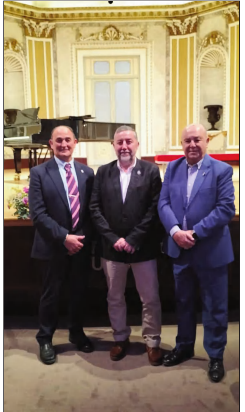
Representación peñista en el concierto.