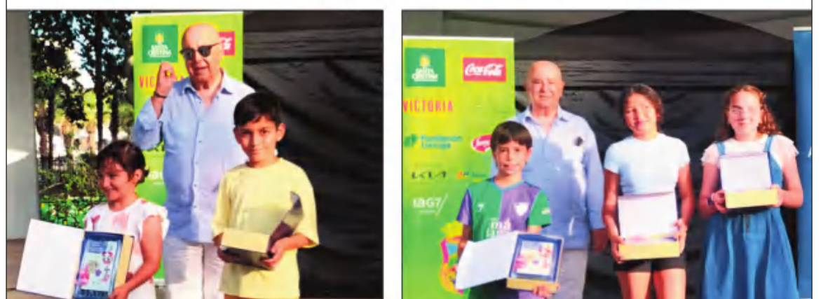
Premiados de la edición del pasado año.