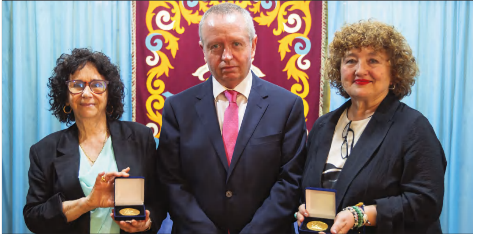
El presidente de UNEE con las dos galardonadas.

Como reflejo de esa apuesta por las distintas lenguas del país el presidente de la Unión comenzó su intervención saludando a los asistentes en castellano, catalán y gallego. Heredia recordó que a finales de 2027 se celebrará el cincuentenario de la Unión, destacando la coincidencia con el centenario de aquella Generación "que tanto aportó a nuestra entidad en sus comienzos", en referencia a la figura de Rafael Alberti, fundador del Sindicato Nacional de Escritores de España, del que procede la actual UNEE. Heredia, así, quiso felicitar expresamente a las autoridades malagueñas por las iniciati-