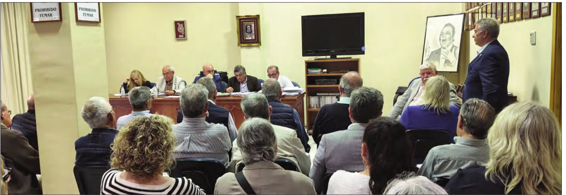
La Federación Malagueña de Peñas, Centros Culturales y Casas Regionales 'La Alcazaba' celebraba este martes 21 de abril su Asamblea General Ordinaria.

Número 845 22 de abril de 2026 C/ Pedro Molina, 1 Tfno: 952 603 343 E-mail: prensa@femape.com Web: www.femape.com Edición digital: www.femape.com/la-alcazaba-periodico X: @FMPLaAlcazaba Facebook: FMPLaAlcazaba