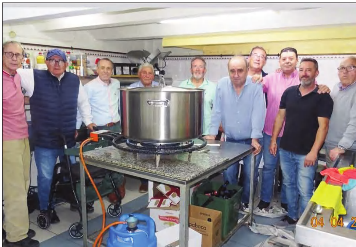
'Los del Rinconcillo', en la cocina preparando su comida del 4 de abril.

• ASOCIACIÓN FOLCLÓRICO CULTURAL JUAN NAVARRO