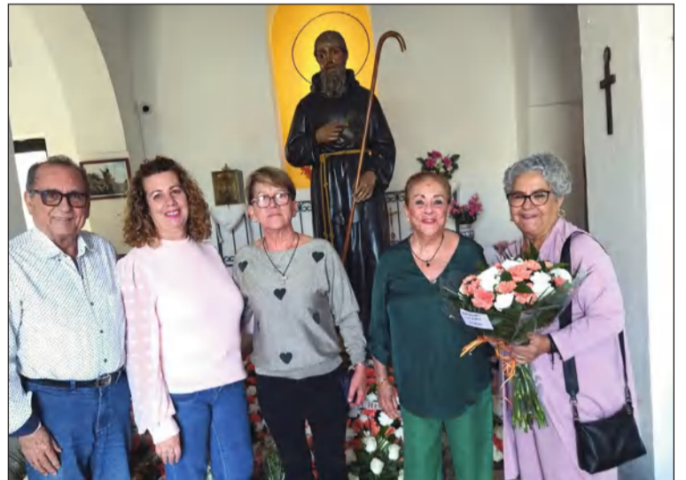
Ofrenda floral a San Francisco de Paula.

Un día antes, representantes de la Asociación Folclórico Cultural Solera realizaron la ofrenda floral a San Francisco de Paula, patrón de la barriada de Viñagrande, en su ermita del Alamillo, en Alhaurín de la Torre.