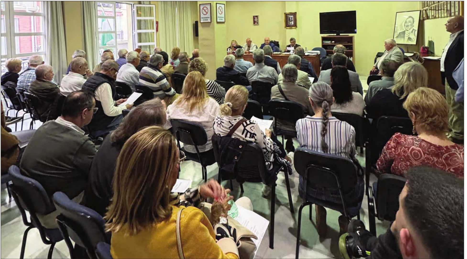
La Asamblea contó con una amplia representación por parte de las entidades que conforman la Federación.

• FEDERACIÓN MALAGUEÑA DE PEÑAS, CENTROS CULTURALES Y CASAS REGIONALES 'LA ALCAZABA'