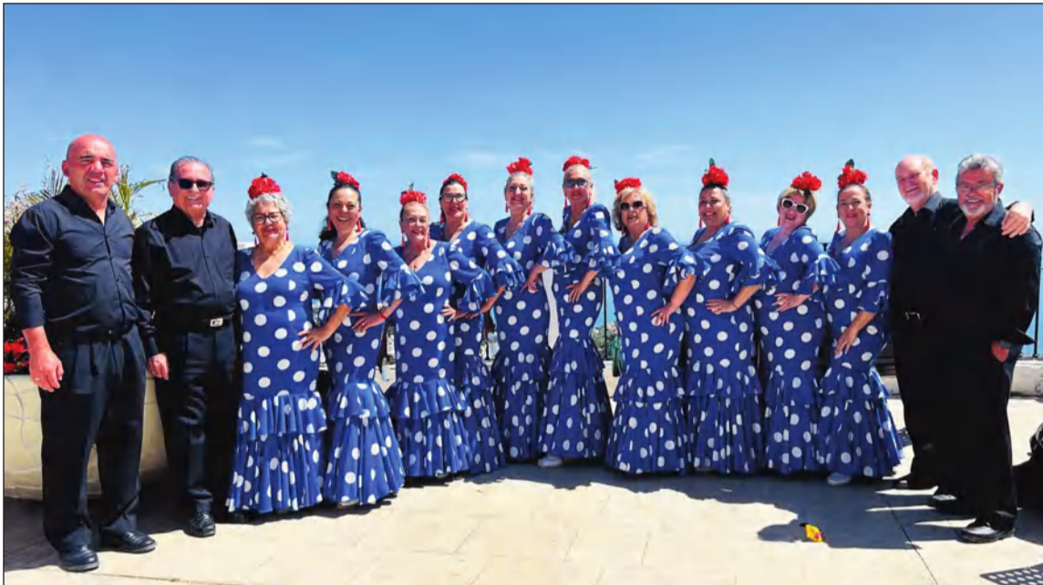
Componentes del Grupo Folclórico antes de actuar en Benalmádena.