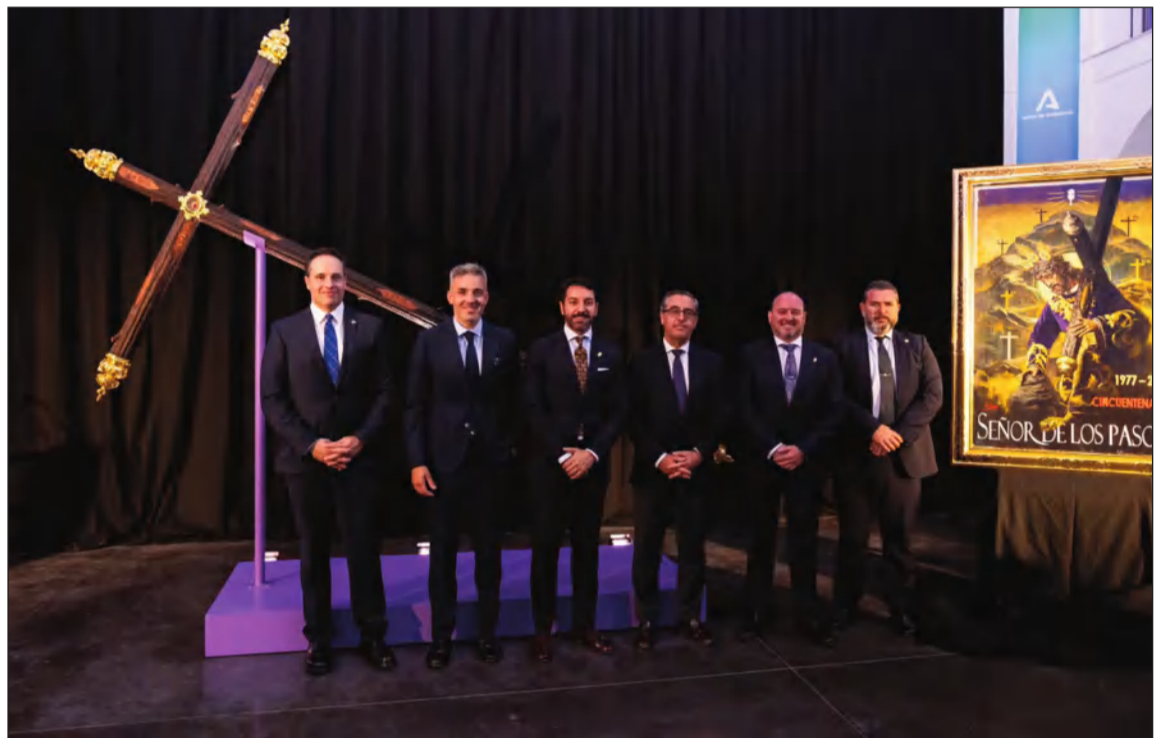
Acto de presentación de 'La Cruz del Mundo' y el cartel del 50 Aniversario de la bendición del Señor de los Pasos.