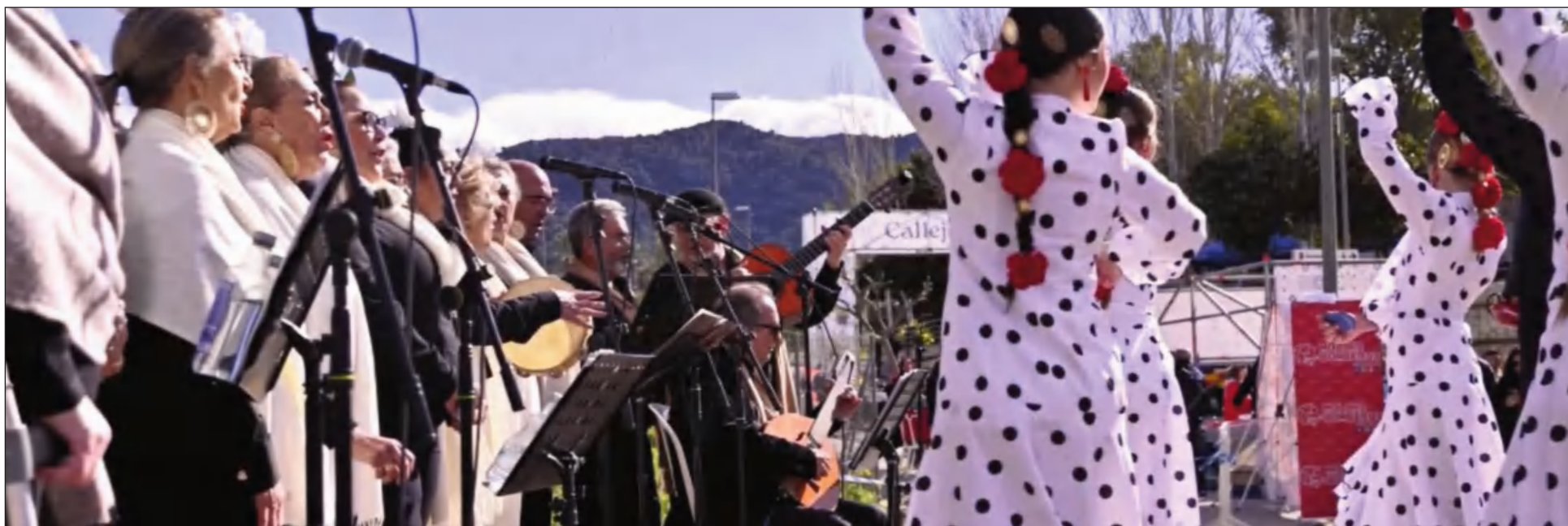
Actuación de la Asociación Folclórico Cultural Solera en Callejea 2026.