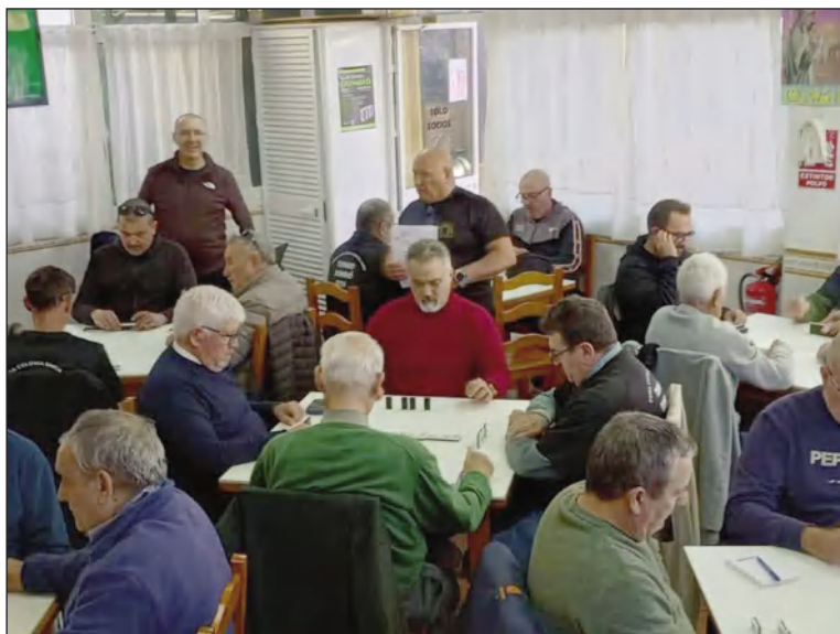
Vista del salón durante el torneo. Puerta Blanca.