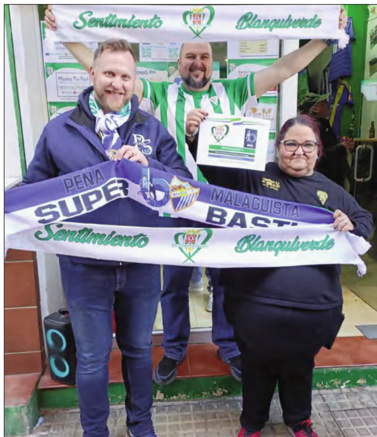
El presidente de la Peña Súper Basti, con aficionados cordobeses.