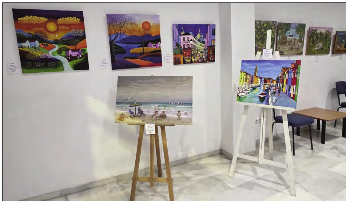
Vista de la exposición.

Podrá contemplarse hasta el día 13 de febrero en horario de 10 a 13 horas de lunes a viernes. La exposición convocó a una gran cantidad de personas, amantes de este arte emergente, que no quisieron perderse la oportunidad de ver reunidos las obras de estos grandes artistas.