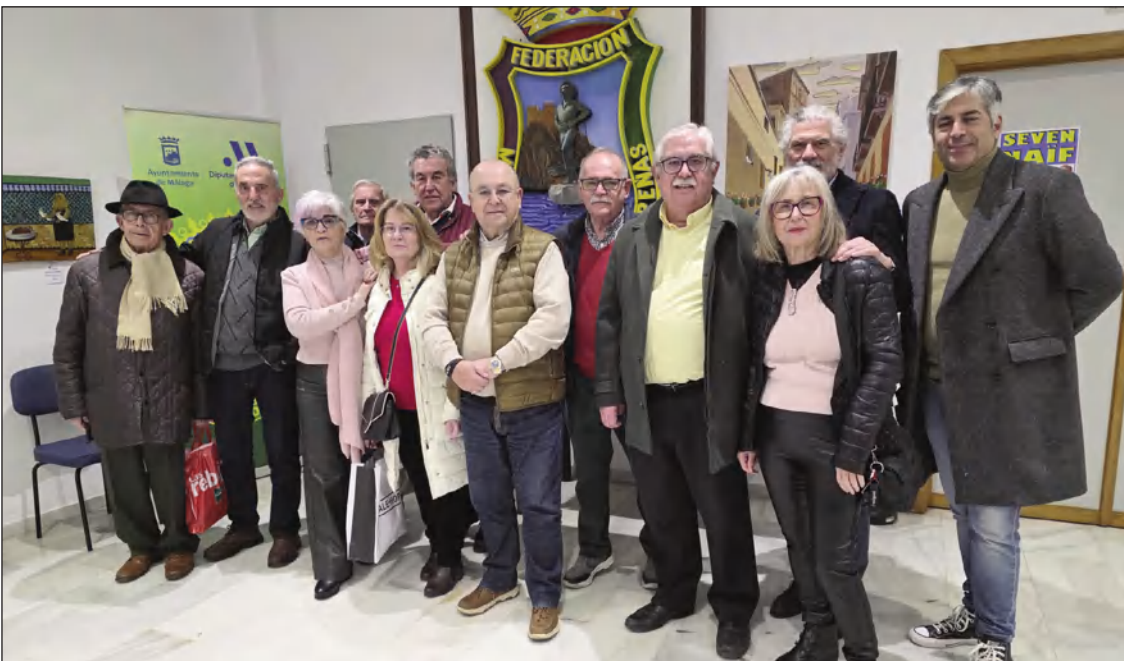
Siete artistas malagueños ofrecen una muestra temporal hasta el 13 de febrero en la sede de la Federación de Peñas.