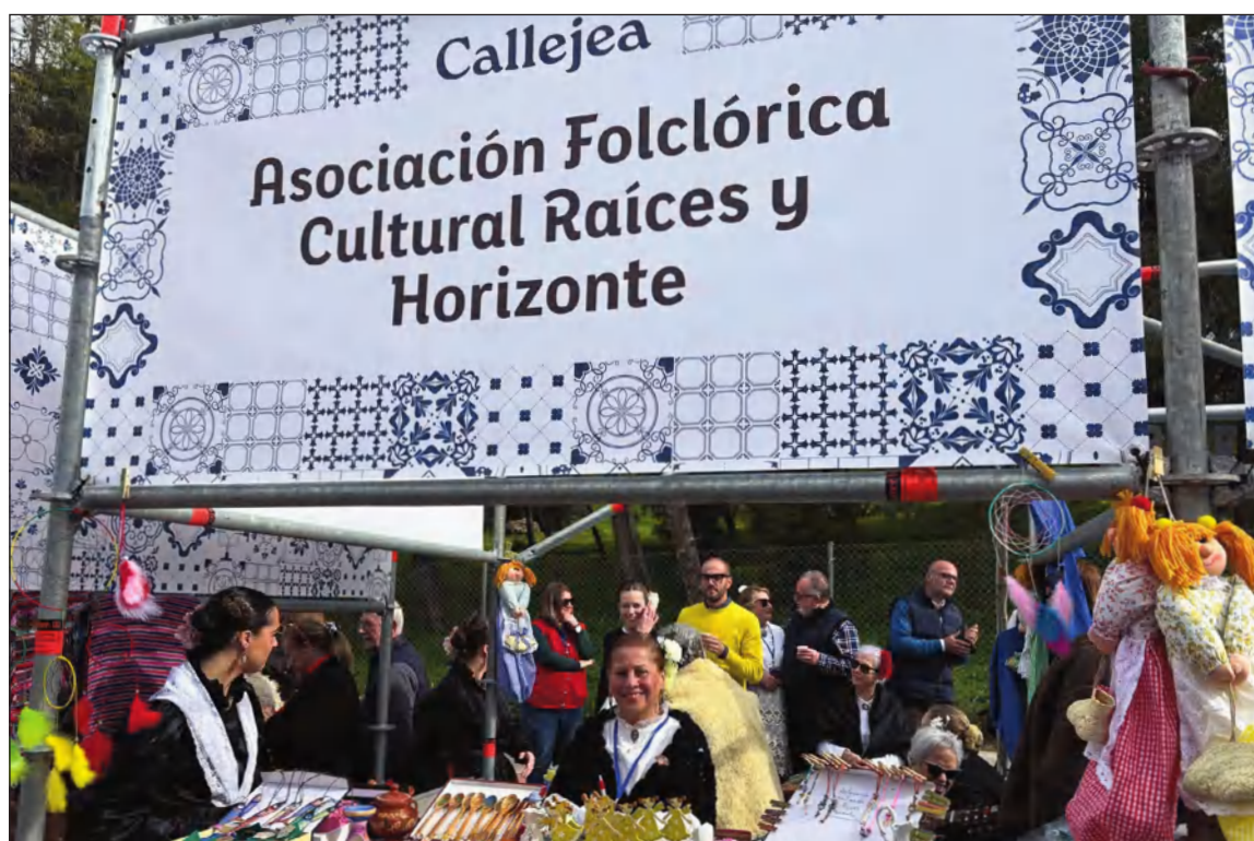
Stand de Raíces y Horizonte en la zona expositiva.