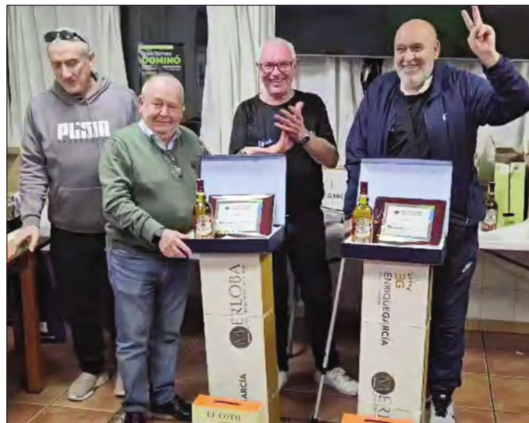
Entrega de premios a los ganadores.

Así se conseguía un día memorable en el que todos pudieron disfrutar en esta entidad federada de una jornada de convivencia en un ambiente festivo y amigable.