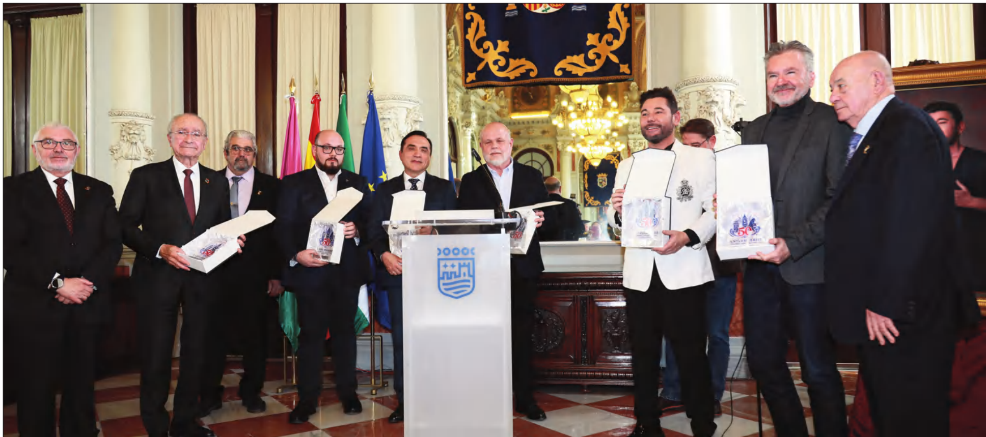
Agradecimiento de la Peña Recreativa Trinitaria a los colaboradores en el 50 Concurso Nacional de Saetas.