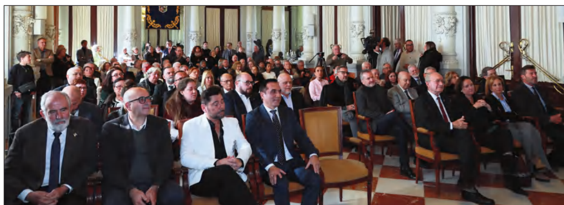
El acto se celebraba en un abarrotado Salón de los Espejos del Ayuntamiento de Málaga.