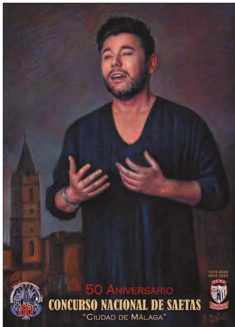
Cartel realizado por Antonio Montiel.