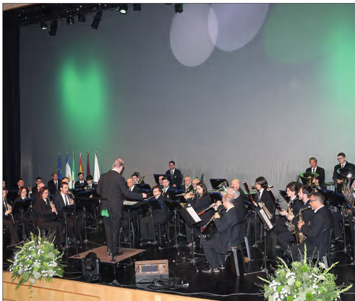
La Banda de Música Municipal de Málaga acude cada año al acto del Día de Andalucía organizado por la Federación.