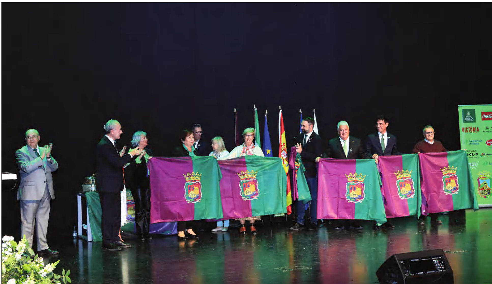
Entrega de banderas del Ayuntamiento de Málaga en el Día de Andalucía 2025, con la presencia del alcalde Francisco de la Torre y otras autoridades municipales.