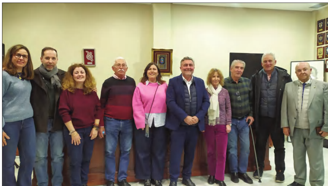
El nuevo presidente de El Portón, con socios de la asociación y el presidente de la Federación Malagueña de Peñas.