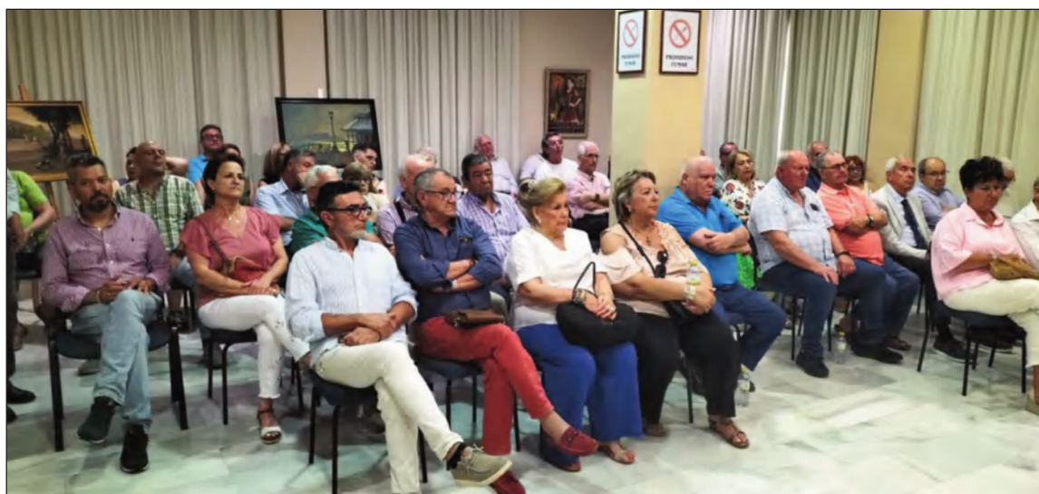
Representantes de las entidades federadas en una de las asambleas celebradas.

Este conocimiento nos va a permitir diseñar programas y servicios (formación, recursos, etc.) que respondan a las necesidades reales de las asociaciones, maximizando el impacto y la sostenibilidad de las iniciativas.