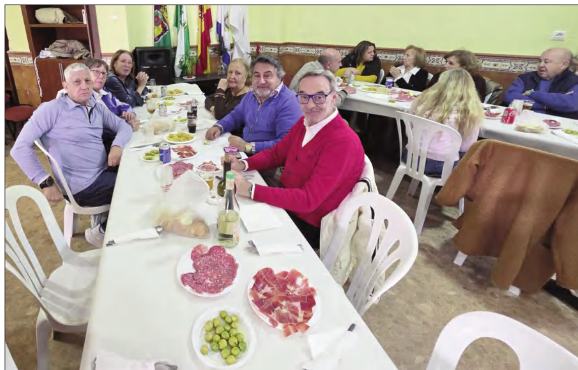
Vista del salón de la Peña La Florida durante la comida de hermandad.