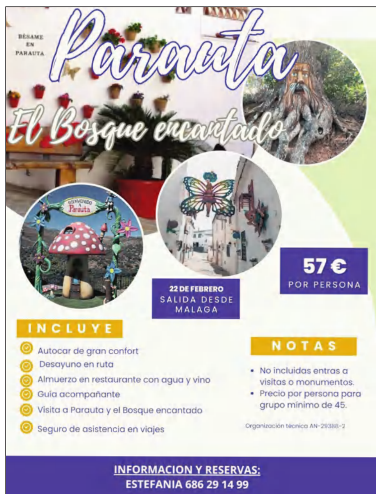
Cartel de la excursión organizada desde la Peña Nueva Málaga.

Se trata de una recreación tallada a mano de personajes mágicos en un sendero entre castaños milenarios que podrán conocer de primera mano los integrantes de esta entidad perteneciente a la Federación Malagueña de Peñas, Centros Culturales y Casas Regionales 'La Alcazaba'