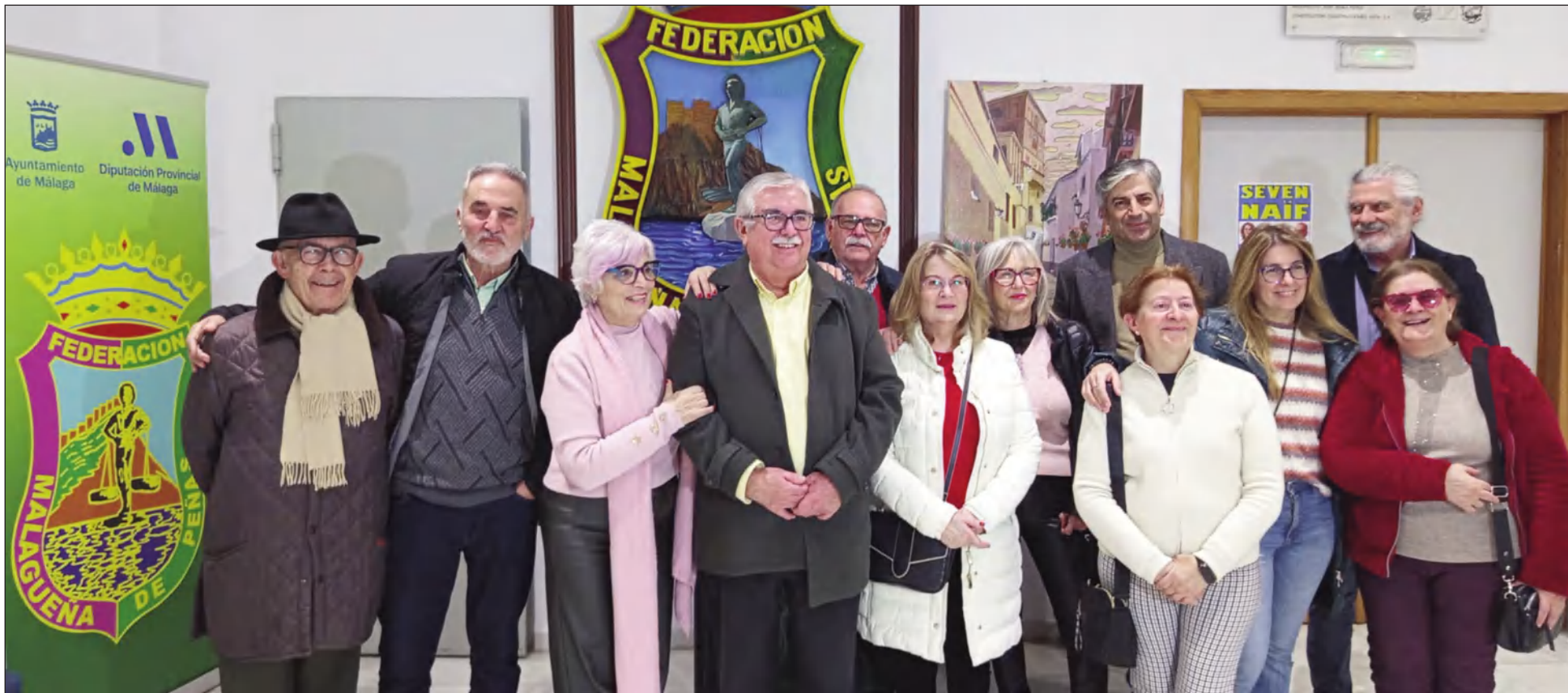
Inauguración de la exposición, en la tarde del pasado lunes 26 de enero.