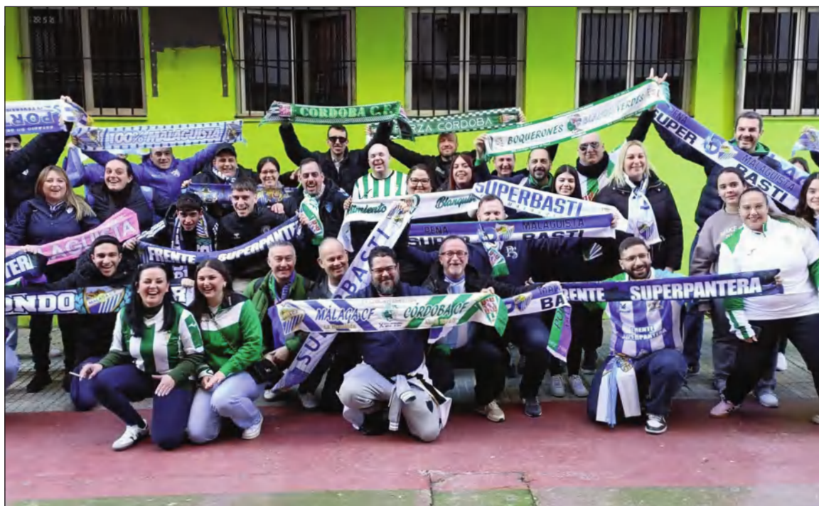
Imagen de grupo de aficionados del Córdoba y el Málaga.

La Peña Malaguista Súper Basti forma parte de la Federación Malagueña de Peñas 'La