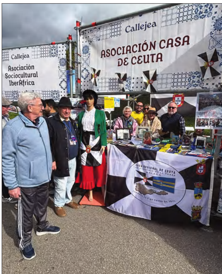
Visita de las autoridades locales al expositor de la Casa de Ceuta.

Callejea es una iniciativa del Ayuntamiento de Alhaurín de la Torre para celebrar la festividad de San Sebastián, patrón de la localidad, y cuenta con la colaboración de las concejalías de Grandes Eventos, Turismo y Fiestas, Servicios Operativos, Servicios Sociales, Comercio, Deportes, Juventud, Patrimonio Histórico y Medio Ambiente.