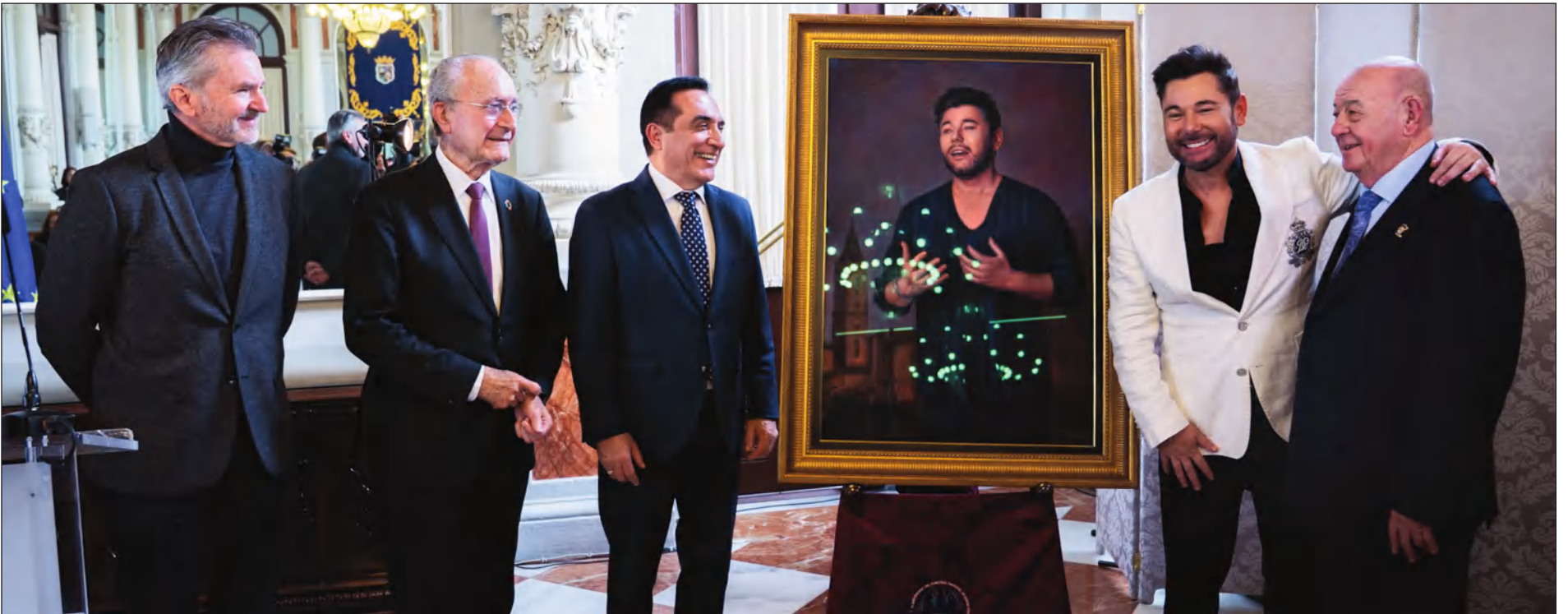
La Peña Recreativa Trinitaria presentaba el 23 de enero el cartel de su 50 Concurso Nacional de Saetas 'Ciudad de Málaga', obra en la que Antonio Montiel plasma al cantante Miguel Poveda.

Web: www.femape.com Edición digital: www.femape.com/la-alcazaba-periodico X: @FMPLaAlcazaba Facebook: FMPLaAlcazaba