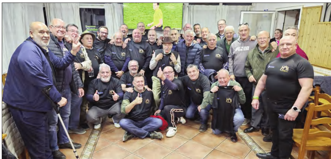
El ambiente festivo y amigable predominó en toda la competición.