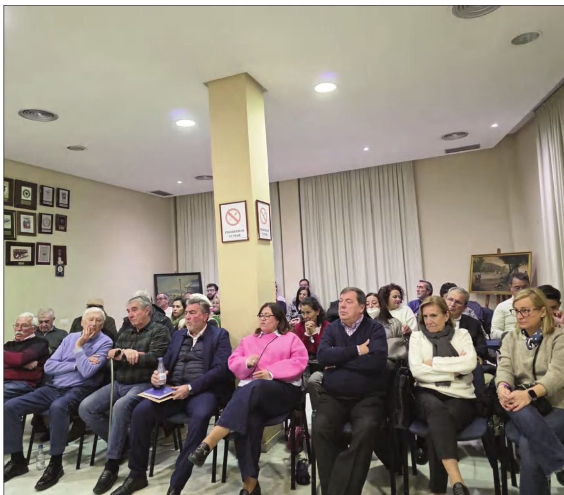
Asamblea de El Portón en el Salón de Actos de la Federación Malagueña de Peñas.