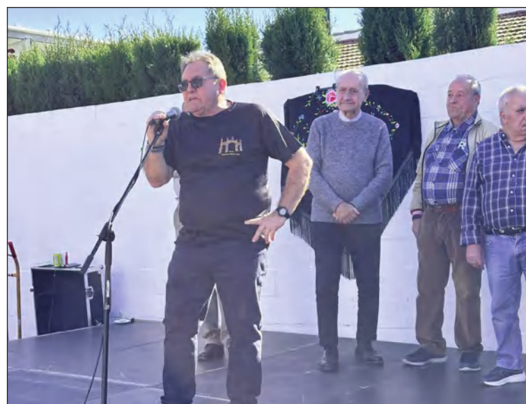
Intervención del presidente, ante el alcalde de Málaga.