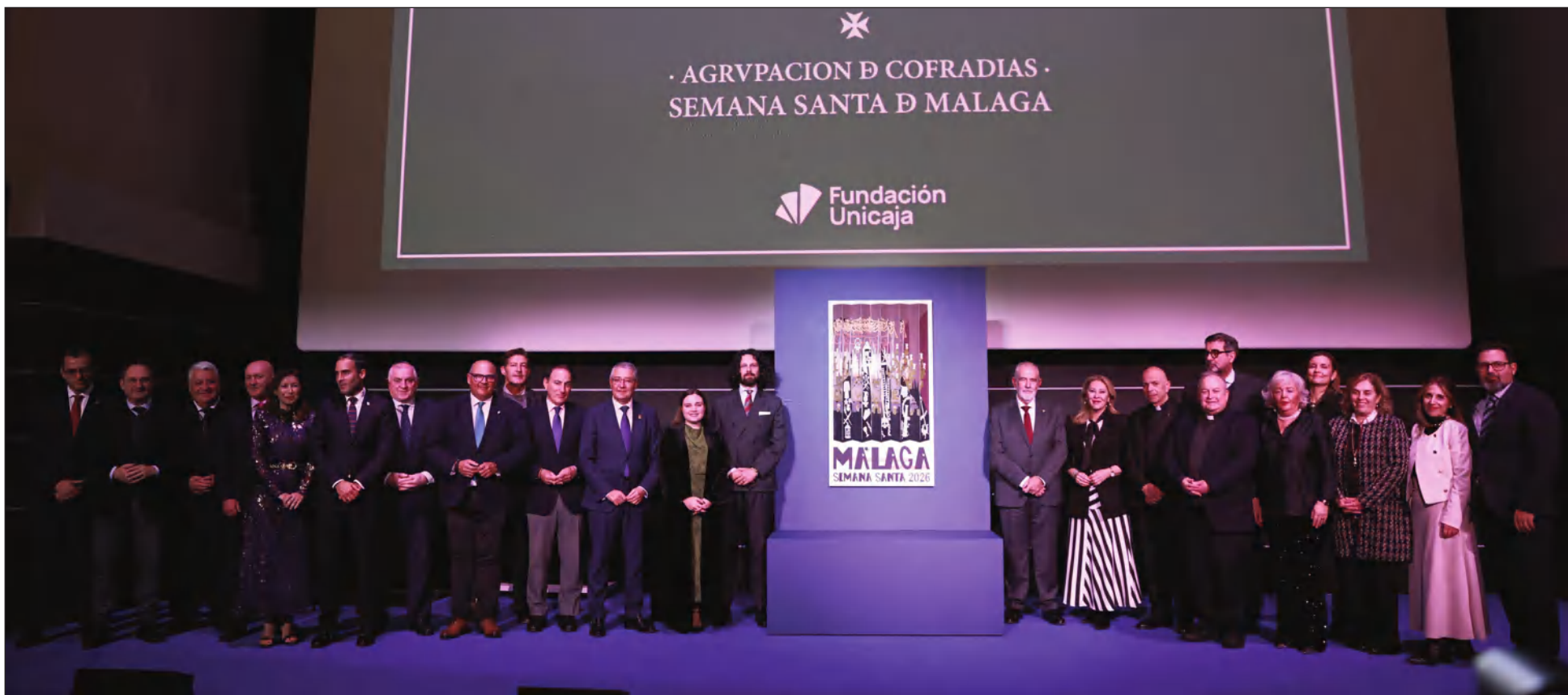
Imagen de grupo con las autoridades y representantes de la Agrupación de Cofradías, junto al cartel de la Semana Santa de Málaga 2026.