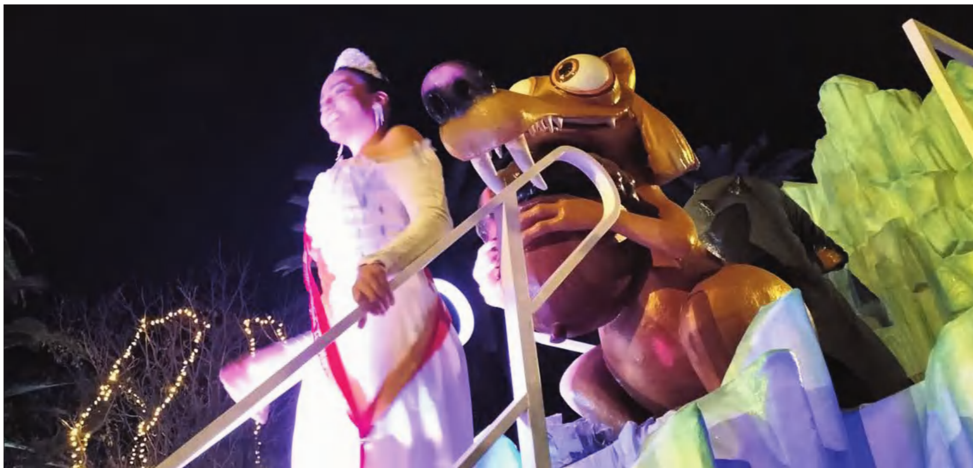
La Reina de la Feria 2025 presidía la carroza de la Federación Malagueña de Peñas, tal y como es tradicional.