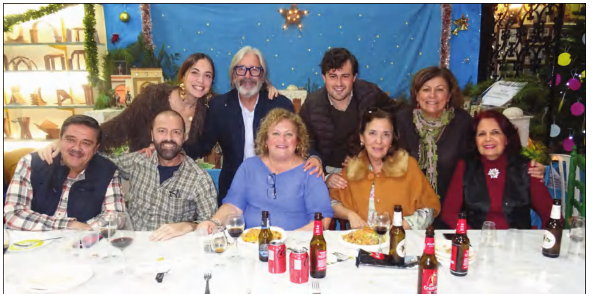
Asistentes a las Migas Flamencas del pasado 24 de diciembre.

lias, que compartieron alegría, villancicos, migas y convivencia. En el ambiente se respiraba el buen espíritu navideño, en una celebración que estuvo amenizada por el grupo "Querencia", que puso música y emoción a la jornada.