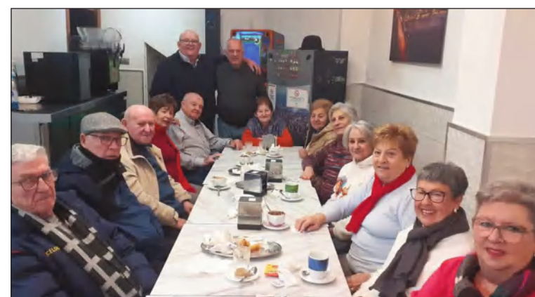
Socios celebrando el 15 aniversario de la asociación.

Desde las Casas regionales de Ceuta se destaca la importancia de este tipo de encuentros digitales para salvar distancias y fortalecer la red que une a quienes mantienen vivo el vínculo cultural con Ceuta desde otras ciudades.