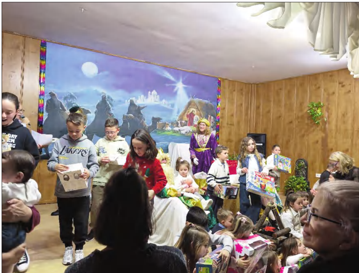
Los niños reciben los regalos de los Reyes Magos.