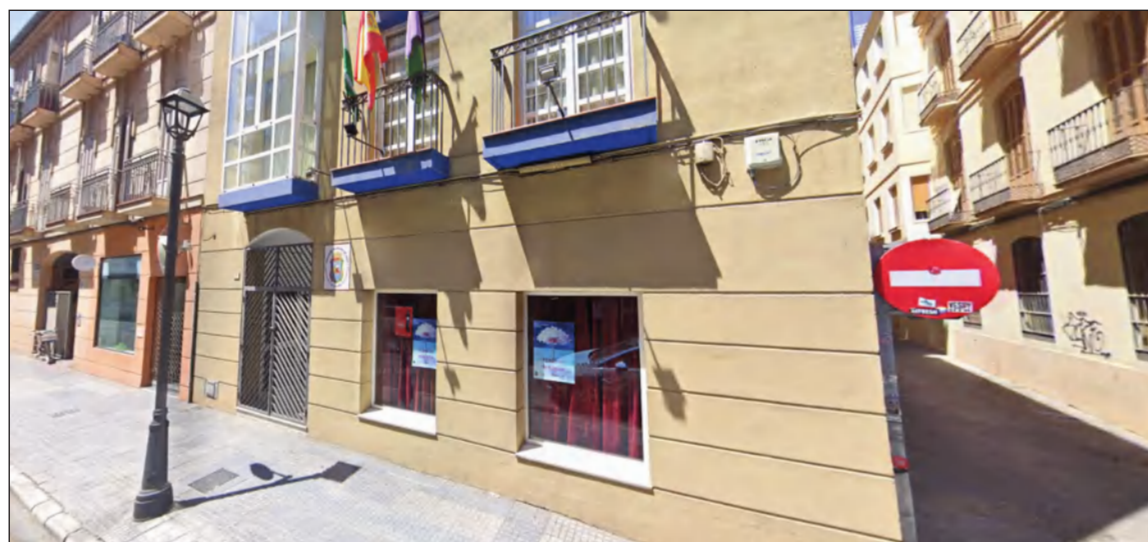
Sede de la Federación Malagueña de Peñas.

Les deseamos lo mejor para este año 2026 que acabamos de comenzar con la ilusión de los Reyes Magos. Una ilusión que tenemos que conservar durante sus doce meses para vivir unidos nuestra esencia como peñistas.