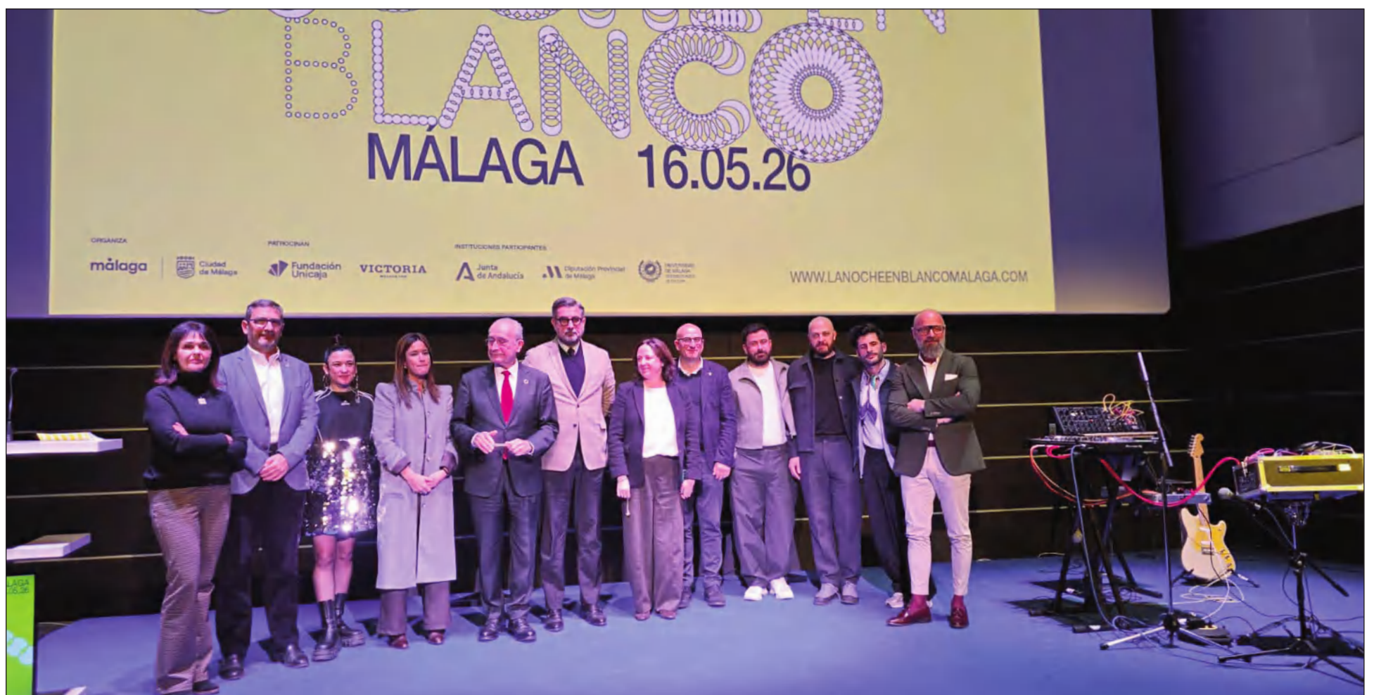
Intervinientes en el acto de presentación de esta iniciativa cultural, programada para el próximo 16 de mayo de 2026.