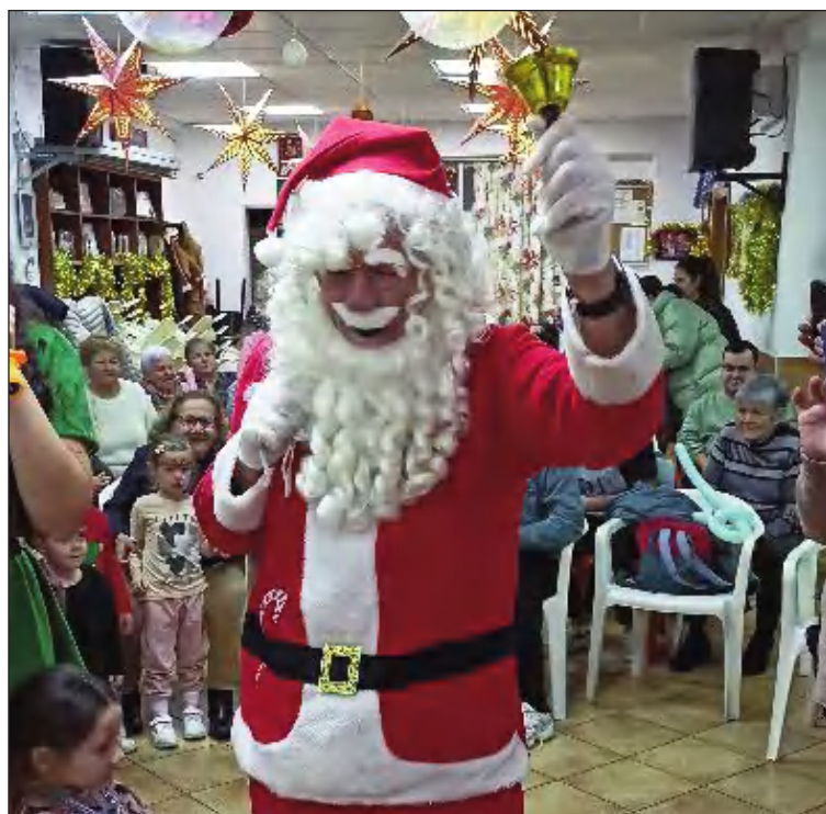
Visita de Papa Noel a la sede de la entidad.