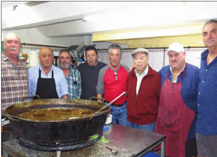
Grupo de Los Albañiles.