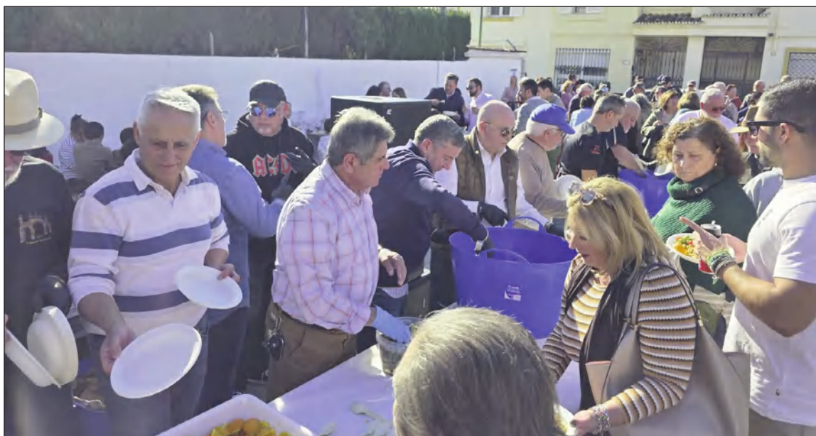
Reparto de Migas de todos los asistentes.