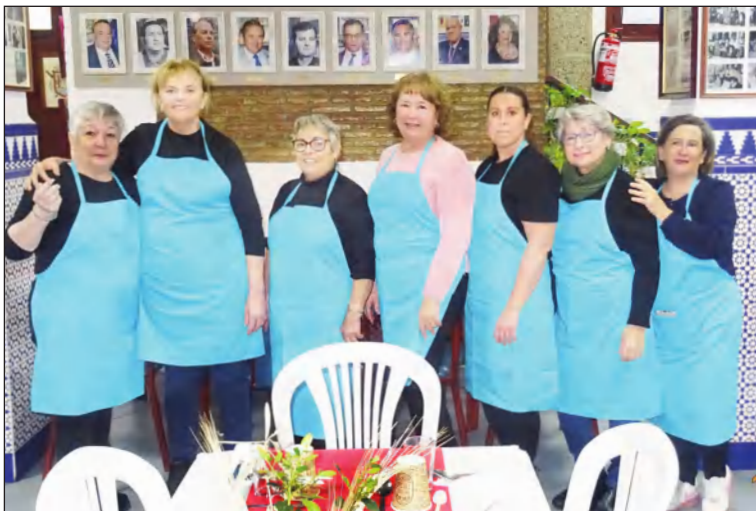
Grupo de Las Suprenas.