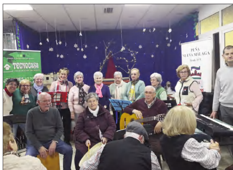
Villancicos en la Peña Nueva Málaga.