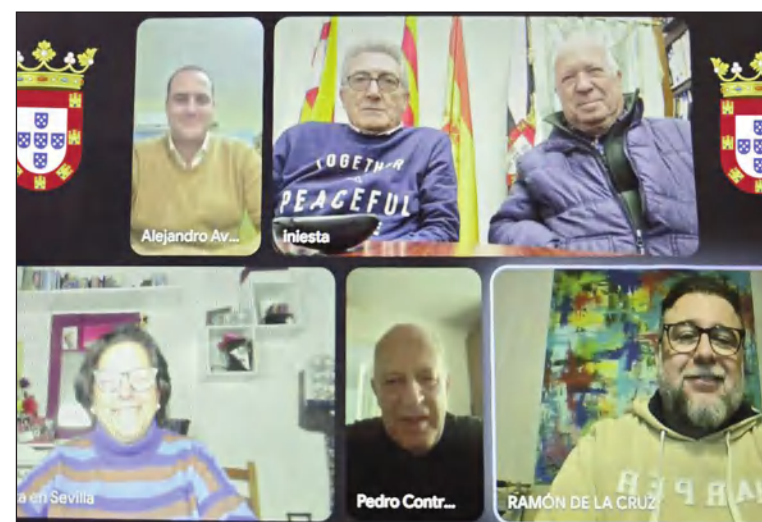
Reunión online de los presidentes de las Casas de Ceuta.