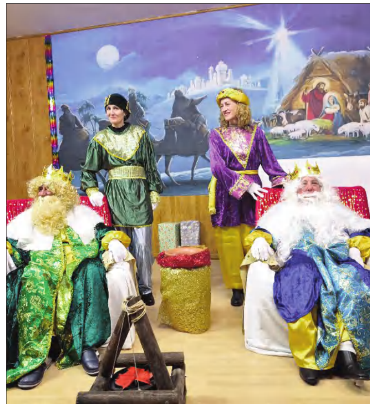
Gaspar y Melchor, con sus pajes en la Peña Santa Cristina.

Los pequeños tuvieron la ocasión de vivir esta ilusión, así como recibir los regalos entregados por los Magos de Oriente.