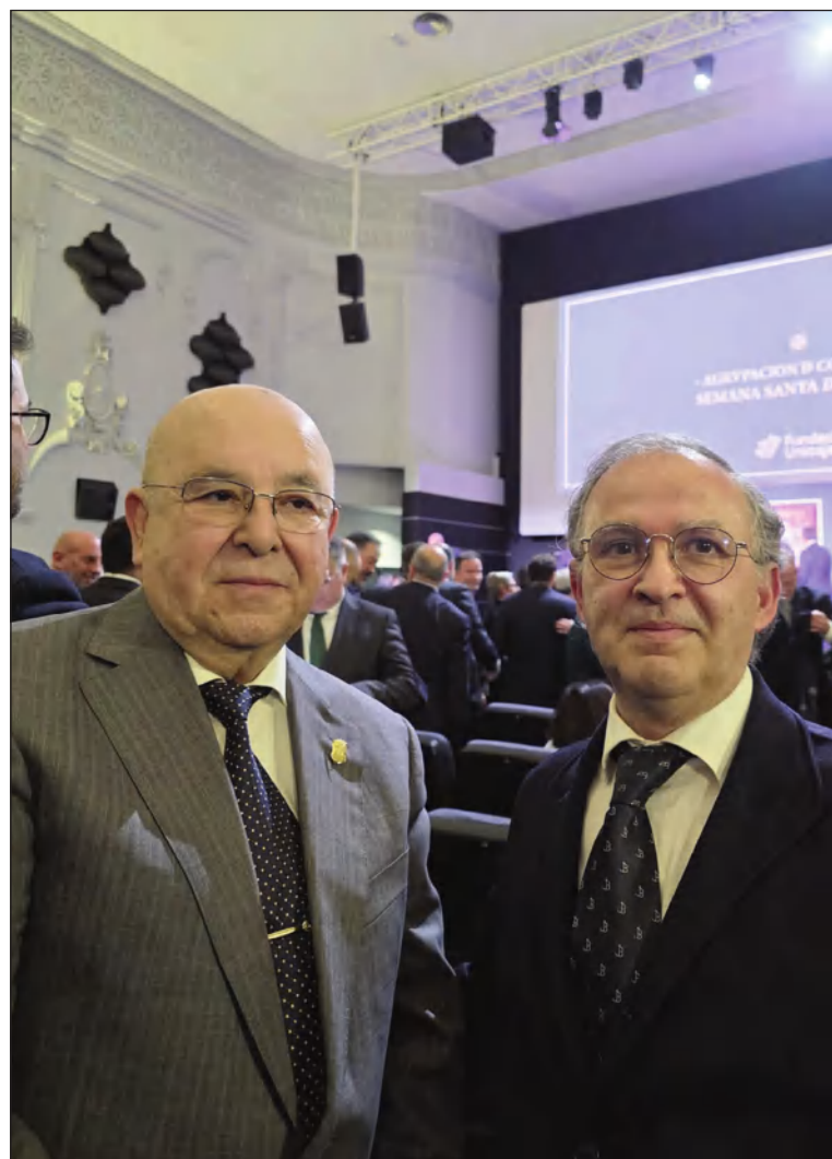
El presidente Manuel Curtido con el Hermano Mayor de la Victoria.