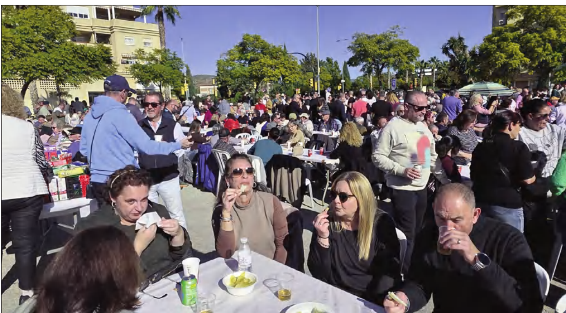
La explanada exterior de la peña estuvo repleta de público disfrutando de esta actividad tradicional.