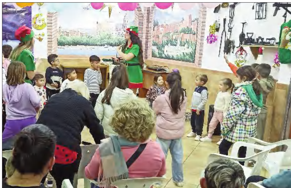
Niños y mayores disfrutaron de la actuación del Grupo Fiesta Increíble.