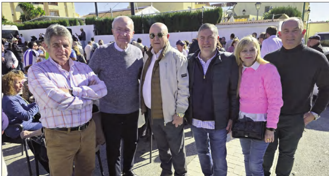
El alcalde con el presidente de la Federación y componentes de la junta directiva.