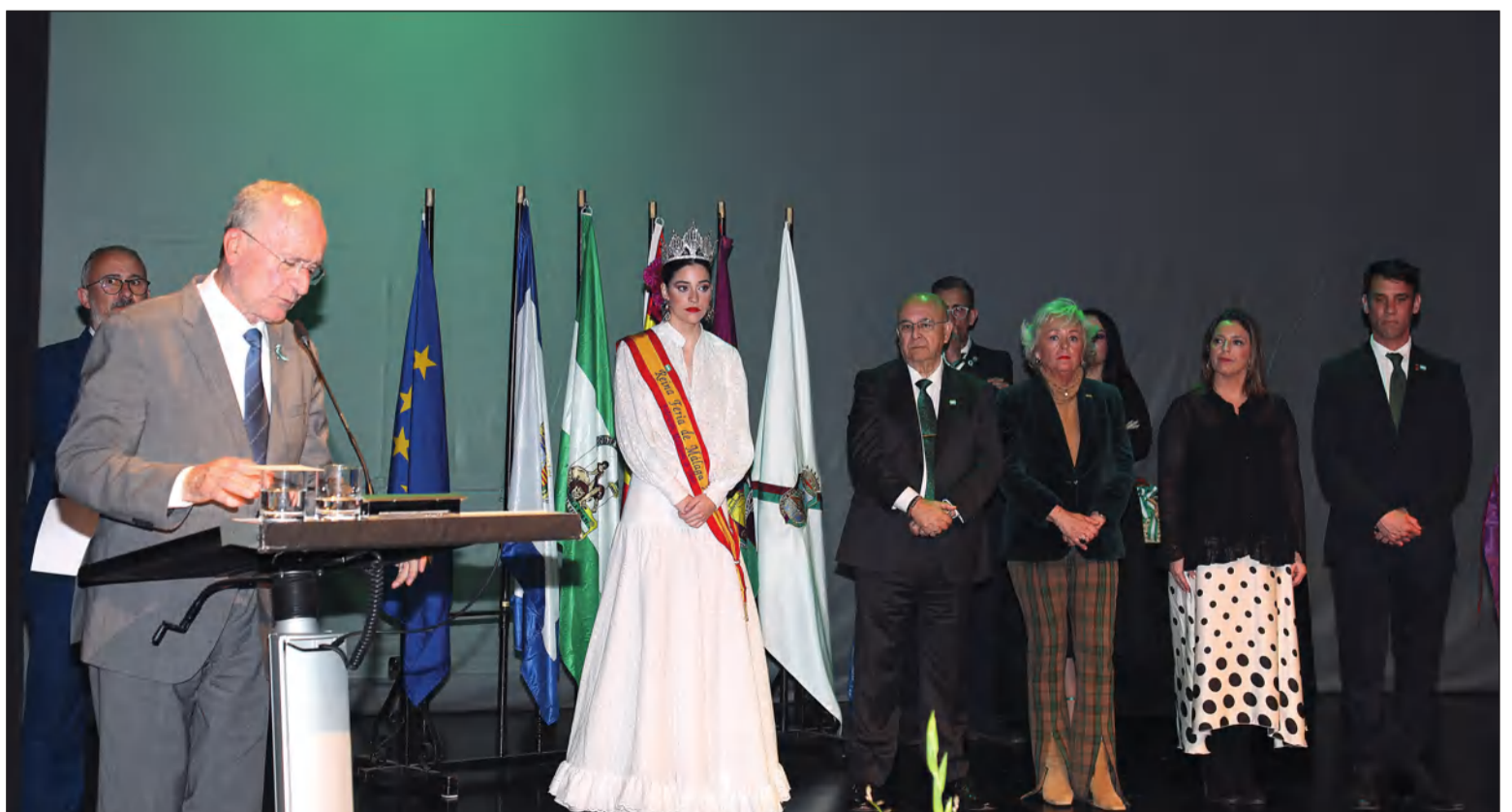
Intervención del Alcalde de Málaga, Francisco de la Torre, en el acto del 28 de febrero del pasado año.