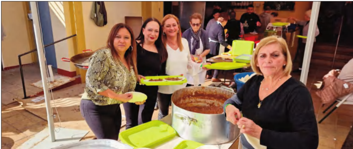
Socias de la Casa de Álora, disfrutando de la Matanza.