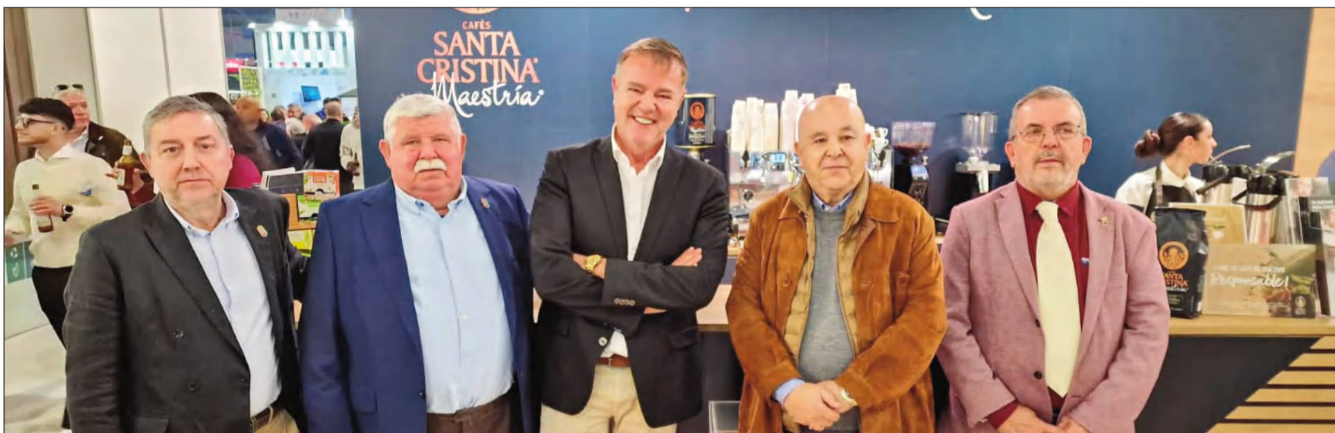
Visita al stand de Cafés Santa Cristina.

La representación peñista tuvo la ocasión de dar la enhorabuena a todos ellos por su trabajo y expresarles una vez más el agradecimiento por su apuesta por Málaga y sus peñas.