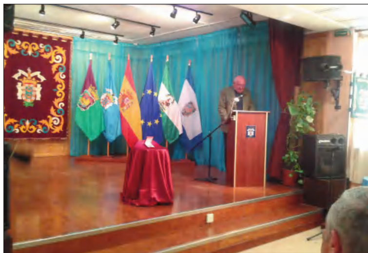
Salón Rusadir de la Casa de Melilla en Málaga.