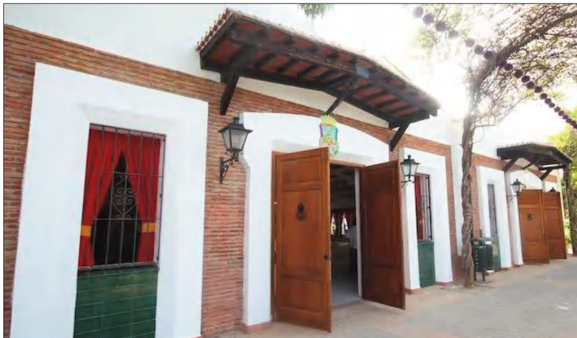
Caseta de la Federación Malagueña de Peñas.

Estas alegaciones buscan mejorar la organización de la Feria de Málaga, garantizar la inclusión de todas las partes implicadas y fomentar la transparencia en los procesos administrativos. Confiamos en que estas propuestas sean consideradas y agradecemos de antemano la atención prestada.