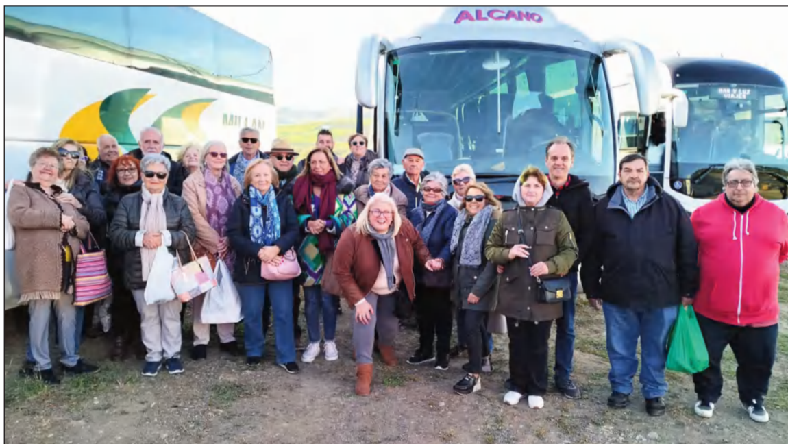
Participantes en la excursión organizada por la Peña Costa del Sol a Ardales.