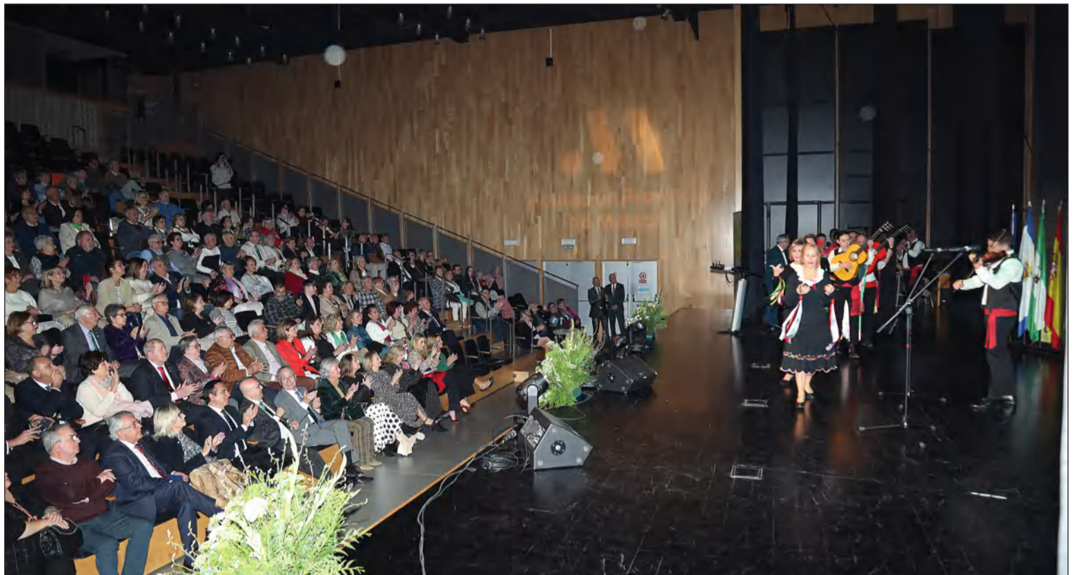
Aspecto del Auditorio Edgar Neville en el Día de Andalucía 2024.

Finalmente, se servirá un aperitivo a todos los asistentes a la conclusión de este emotivo acto.