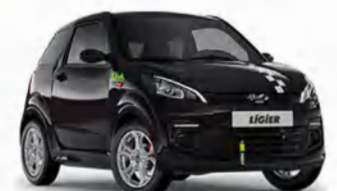
COCHES SIN CARNET