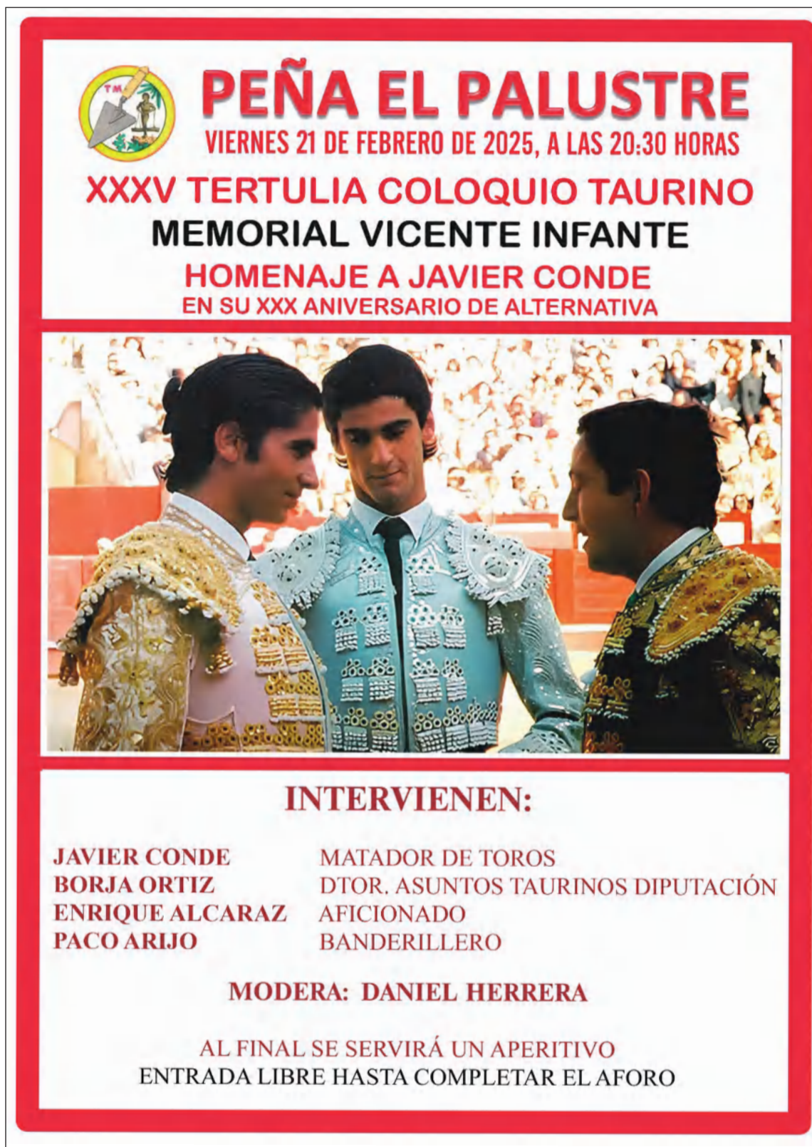
Cartel de la Tertulia Taurina de la Peña El Palustre 2025.

Fue una nueva jornada de convivencia entre los socios de la peña.