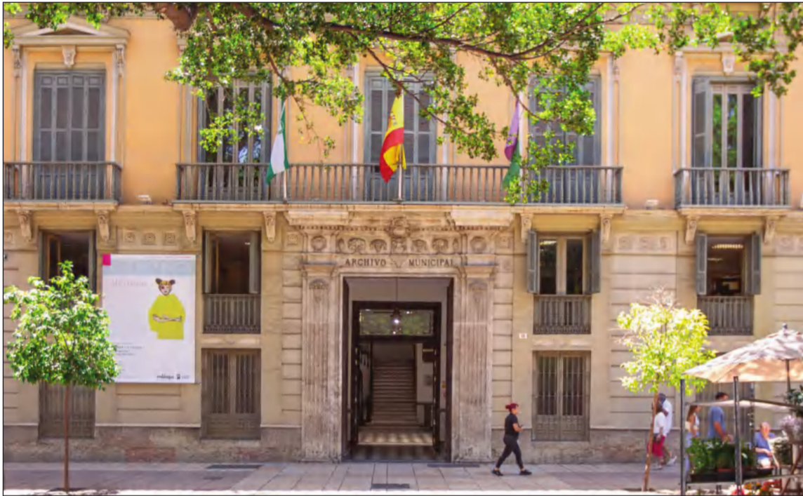
Sede del Área de Cultura del Ayuntamiento de Málaga en el Archivo Municipal.

• FEDERACIÓN MALAGUEÑA DE PEÑAS, CENTROS CULTURALES Y CASAS REGIONALES 'LA ALCAZABA'