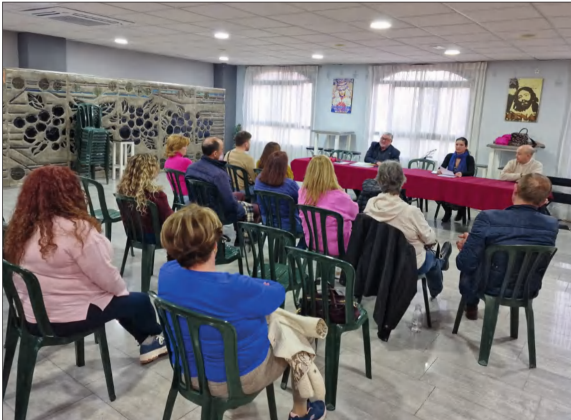
Sesión del Curso de Saeta Malagueña celebrado el pasado año en la Casa Hermandad de La Cena.

Este curso 2025 arrancará el 4 de marzo en la Casa Hermandad de la Sabrada Cena, con el inicio del III Curso de Saeta Malagueña.