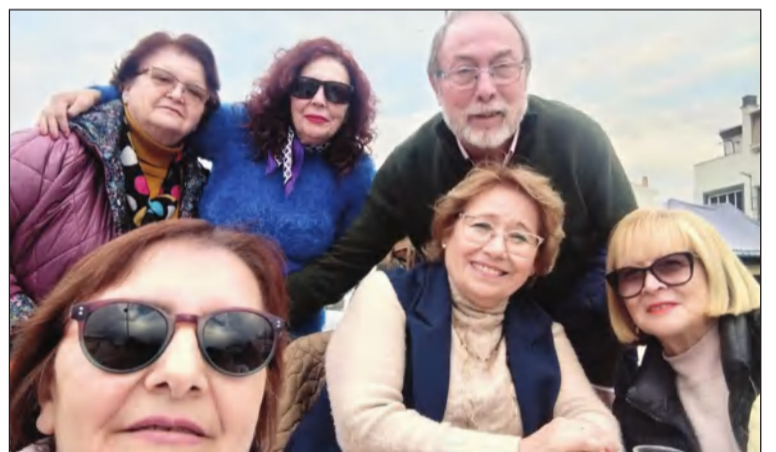
El presidente con socias de la entidad.