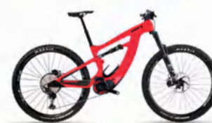
BICIS ELÉCTRICAS DE MONTAÑA