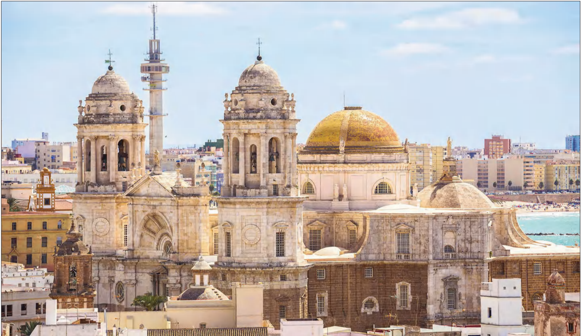
La visita a la ciudad de Cádiz se realizará acompañados por el personaje de Lola La Piconera.

• FEDERACIÓN MALAGUEÑA DE PEÑAS, CENTROS CULTURALES Y CASAS REGIONALES 'LA ALCAZABA'