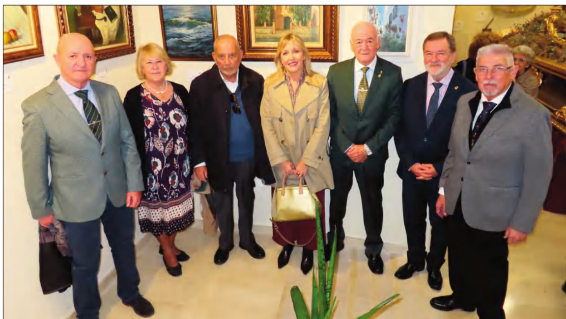
Asistentes a la inauguración de la exposición.