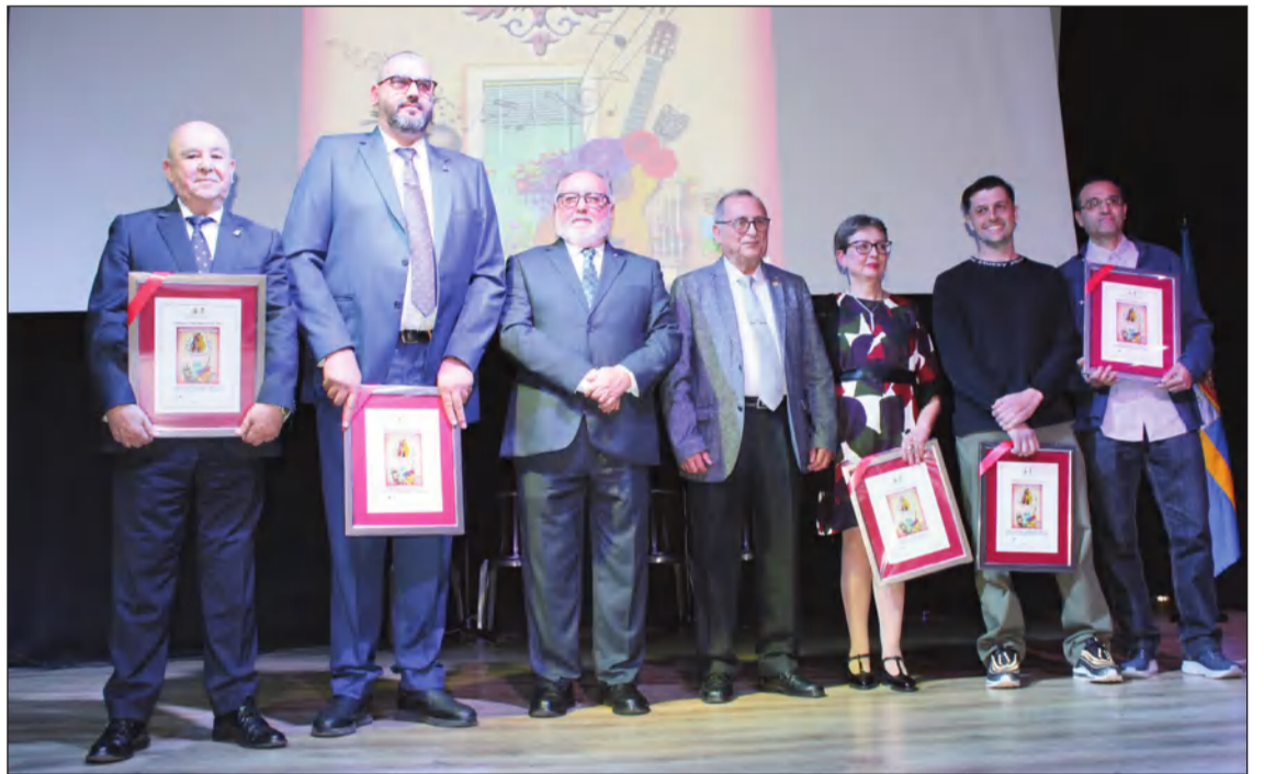
El presidente de la Federación Malagueña de Peñas, Centros Culturales y Casas Regionales 'La Alcazaba' fue distinguido por la Asociación Folclórico Cultural Solera en sus Premios Alhaurinos del Año.