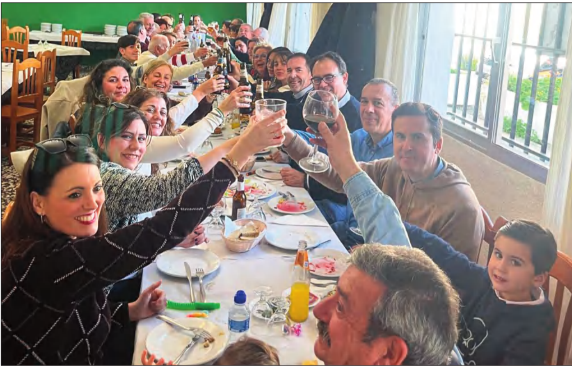
Brindis de los socios de El Portón.

Dado el éxito de esta actividad, plantean realizar nuevos encuentros.