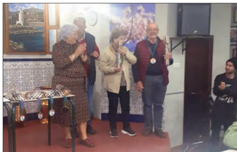
Acto de entrega de trofeos a la conclusión del torneo.