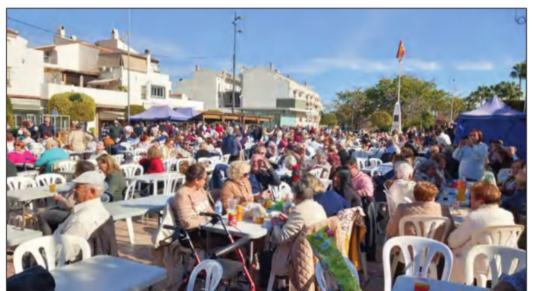
Vista general de la Fiesta de San Sebastián.