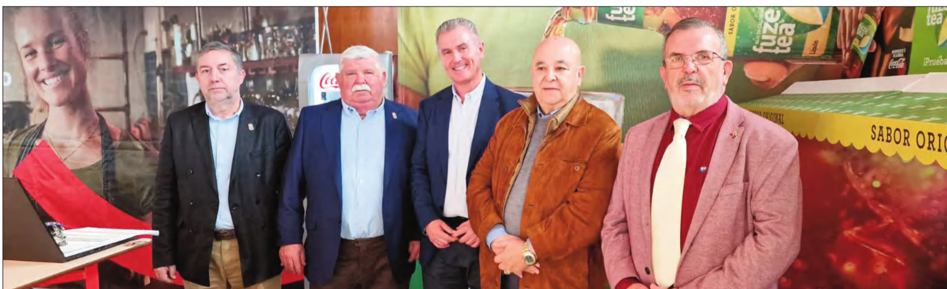
Coca-Cola Europacifics Partner estuvo representado en la Feria.