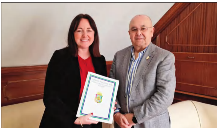
Reunión con la concejal de Cultura, Mariana Pineda.