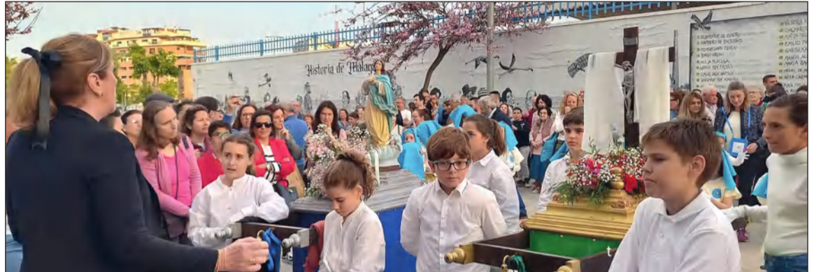
Imagen de la procesión infantil.