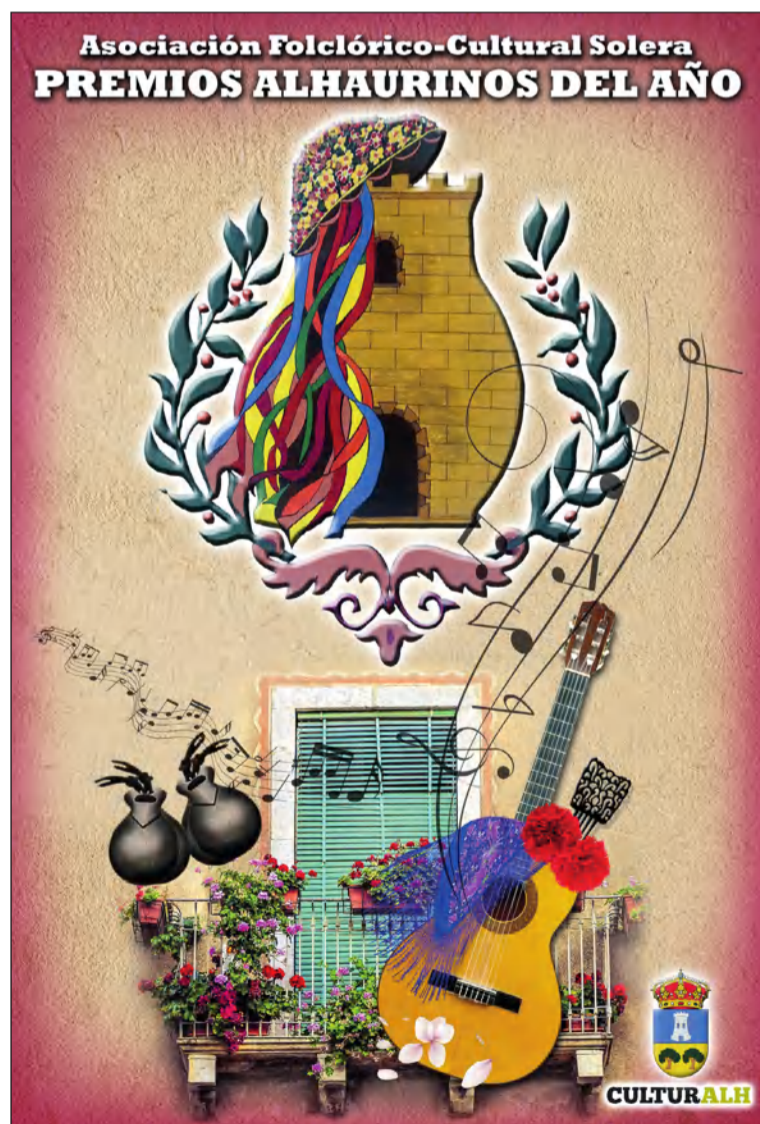
Cartel de los Premios Alhaurinos del Año.