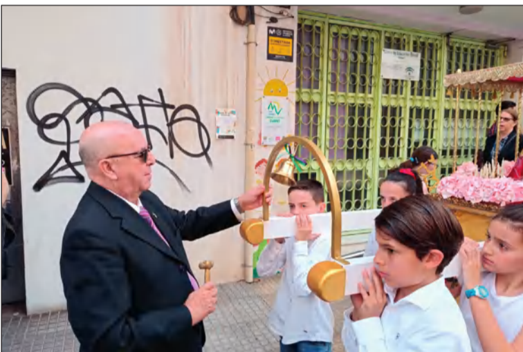
El presidente de la Federación Peñas acompañó a la asociación.

En otro orden de cosas, miembros de la junta directiva de la Asociación de Vecinos