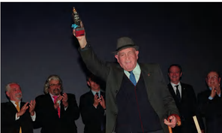
Reconocimiento al Niño de Bonela.