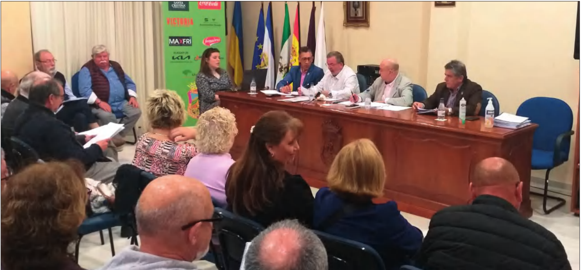
Asamblea General Ordinaria de 2023.

• FEDERACIÓN MALAGUEÑA DE PEÑAS, CENTROS CULTURALES Y CASAS REGIONALES 'LA ALCAZABA'