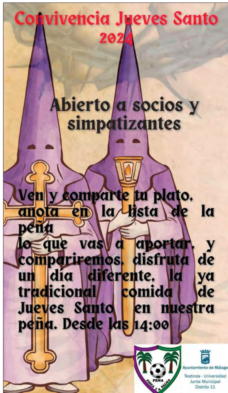
Cartel con todos los detalles de este acto.