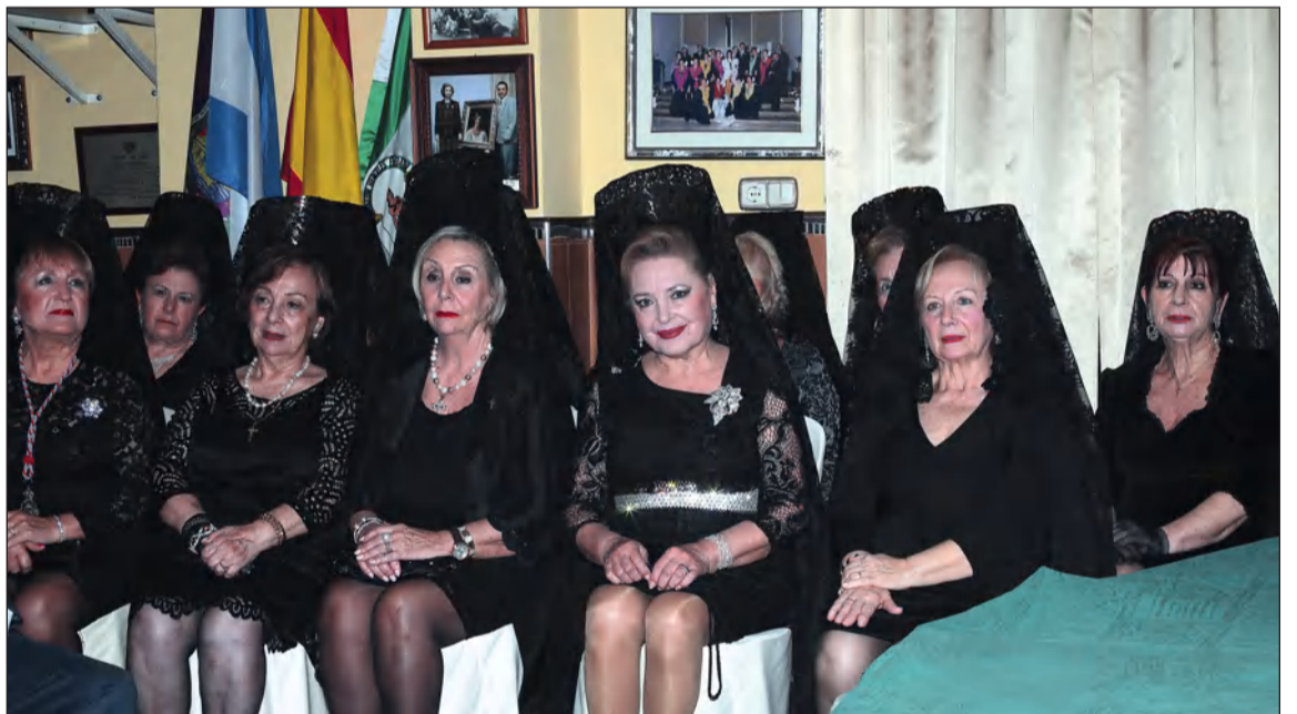
Señoras luciendo la clásica Mantilla Española.