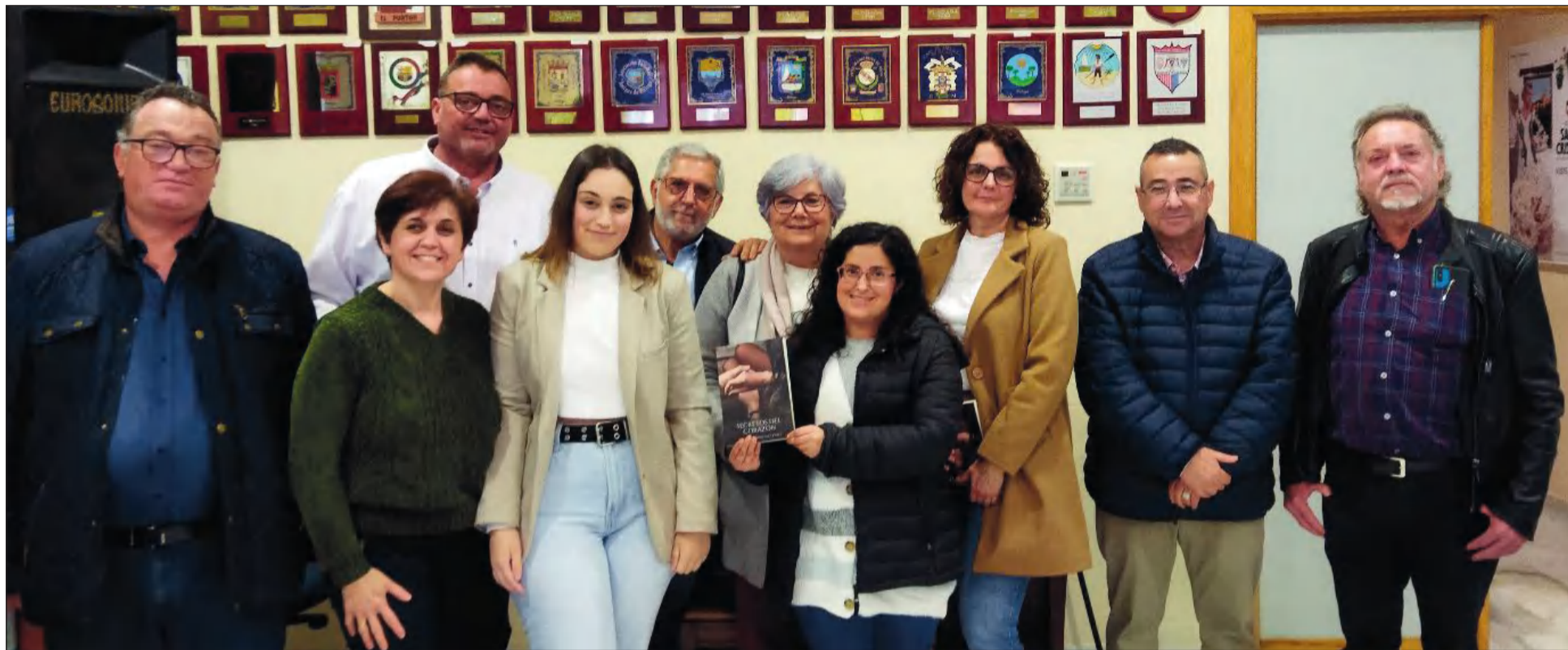
Participantes en este acto cultural celebrado en el salón de actos de la Federación Malagueña de Peñas para presentar la novela 'Secretos del Corazón'.