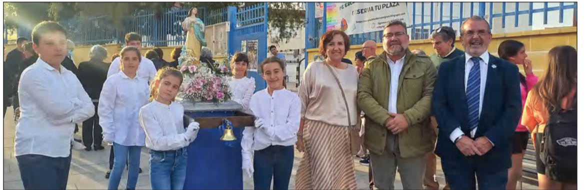
El cortejo estaba organizado por la Asociación Hanuca y el colegio Pintor Denis Belgrano.