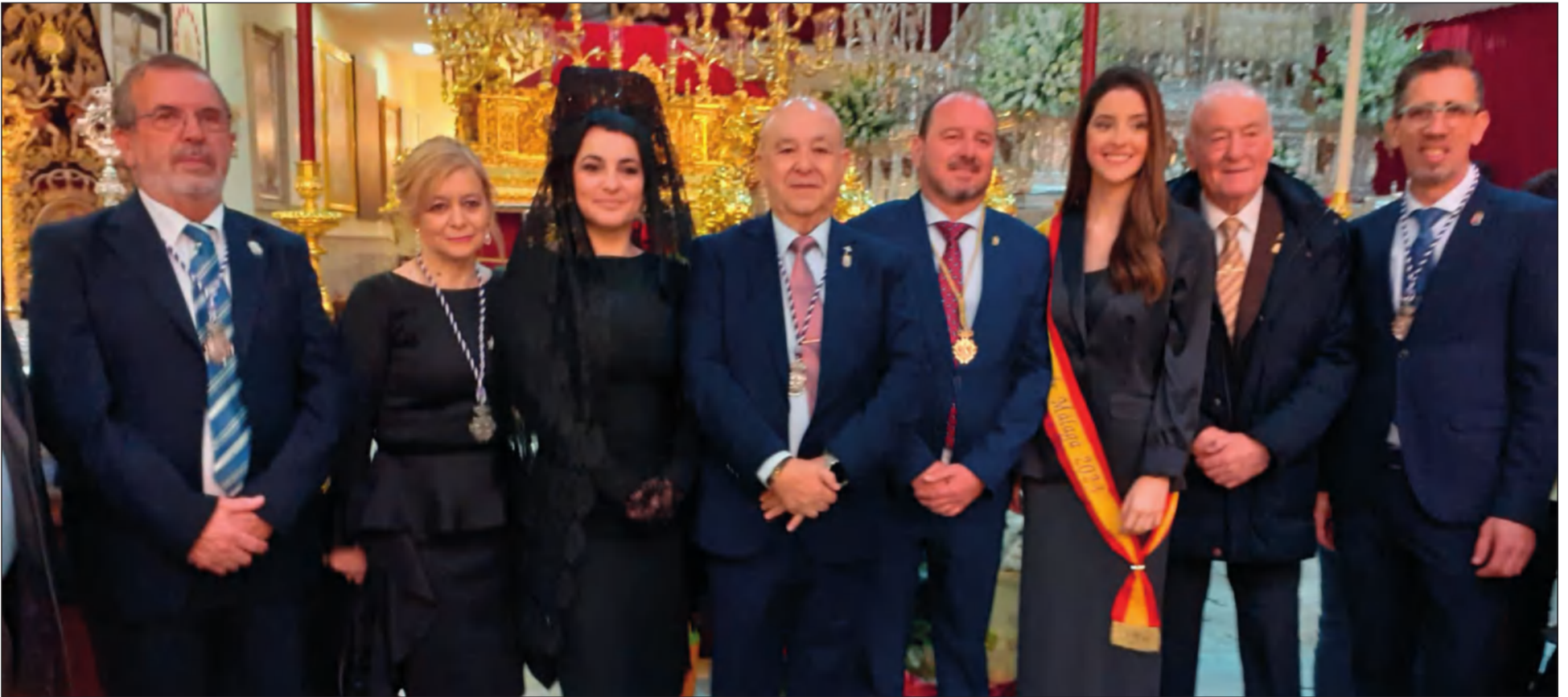
El Hermano Mayor del Rocío recibía a la comitiva peñista, con la presencia de la Reina de la Feria 2023.