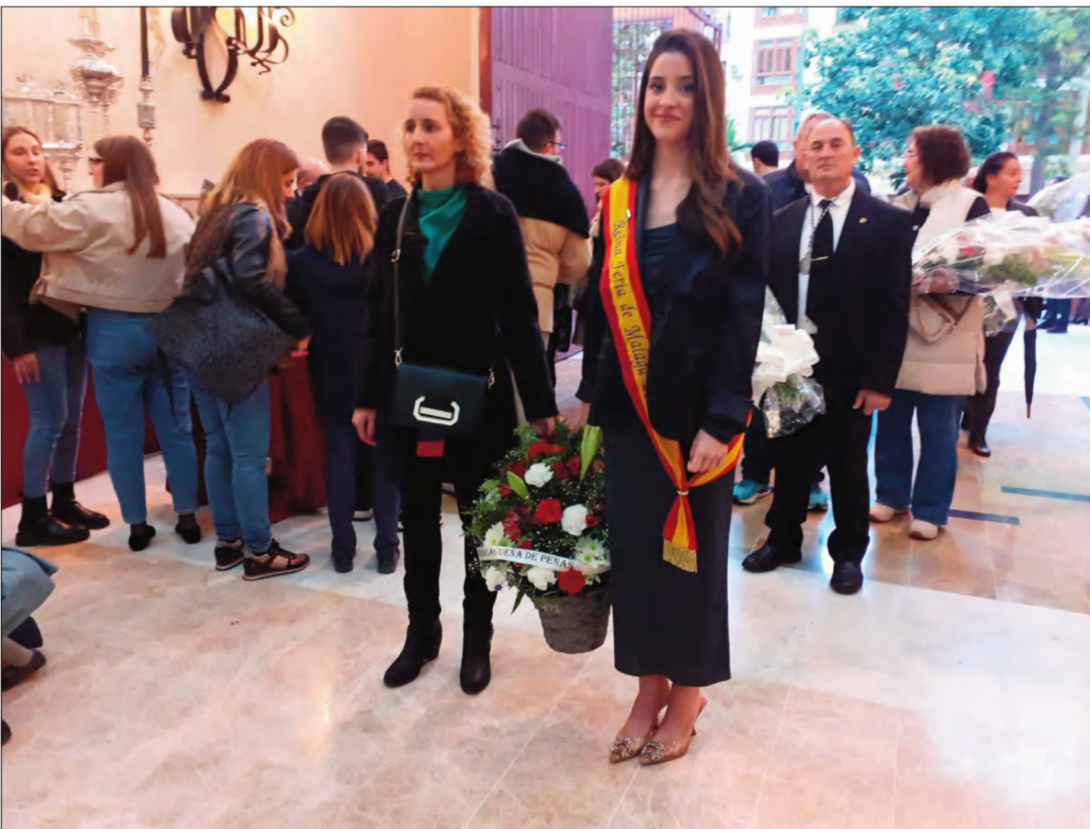
Comitiva peñista accediendo al interior de la Casa Hermandad de la Cofradía del Rocío para realizar su Ofrenda Floral.