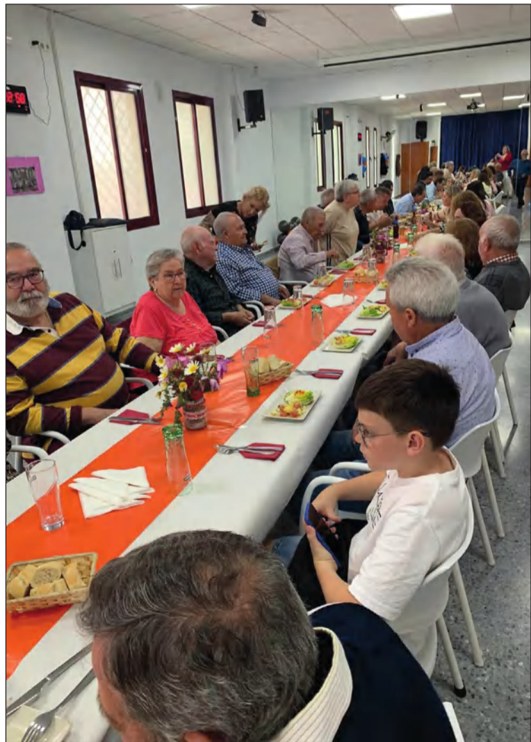
Celebración del Día del Padre de la Peña Finca La Palma.

En esta ocasión, la comida la aportarán los participantes, cada uno un plato para compartir entre todos. Para ello, la junta directiva ha hecho una lista que se encuentra en la sede y en la que cada uno de los asistentes apunta qué es lo que va a aportar en esta jornada de hermandad peñista que se va a vivir en la Peña Finca La Palma desde las 14 horas.