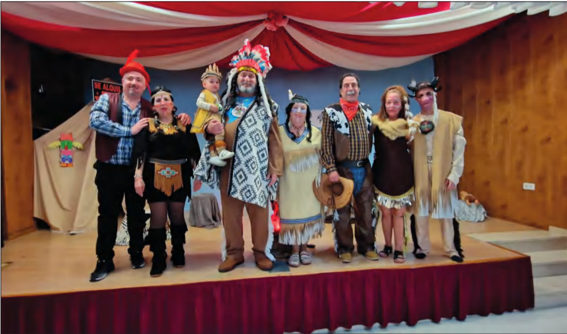
participantes en la representación realizada en la sede de la Peña Santa Cristina.