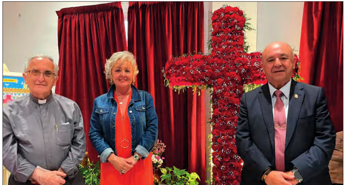
Cruz de Mayo montada por la Federación Malagueña de Peñas el pasado año en su sede.

Por lo pronto, nos adentramos ya en esta nueva estación con la Semana Santa que vivimos en estos días. Un gran acontecimiento al que se une cada año el colectivo peñista desde el respecto a todas sus corporaciones cofrades, y con el afecto y devoción a los Sagrados Titulares de esas corporaciones que en estos días recorren majestuosamente las calles de Málaga.