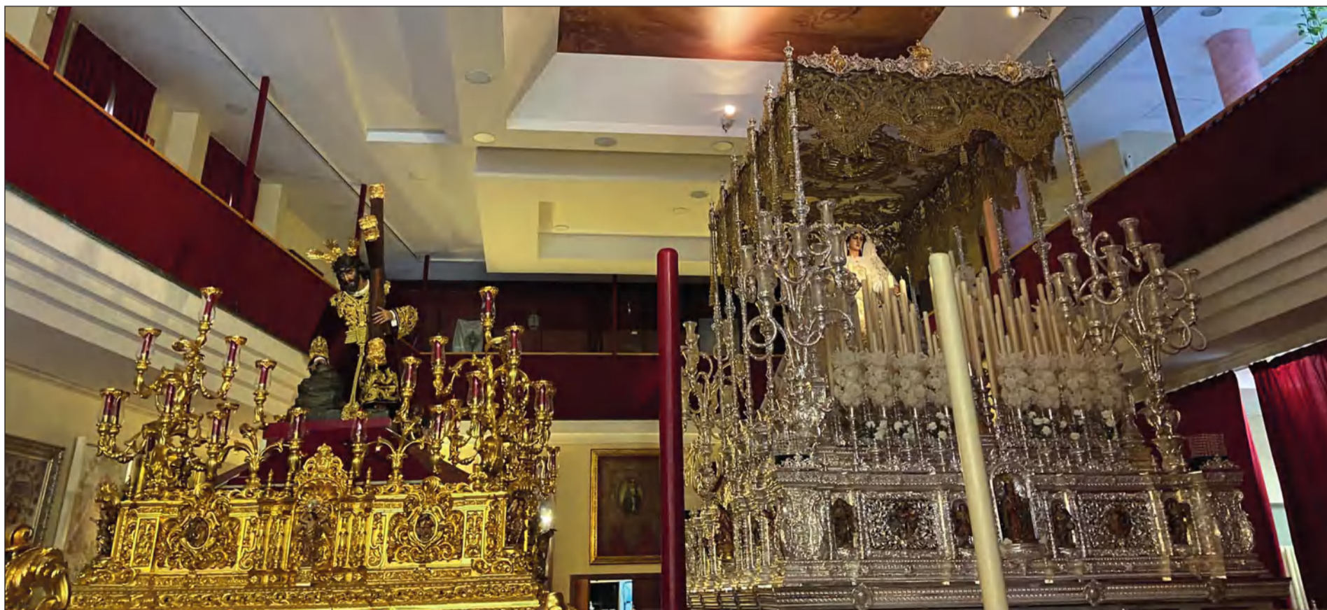
Los Sagrados Titulares de la Cofradía de Nuestro Padre Jesús de los Pasos en el Monte Calvario y María Santísima del Rocío Coronada ya estaban dispuestos en sus tronos procesionales.