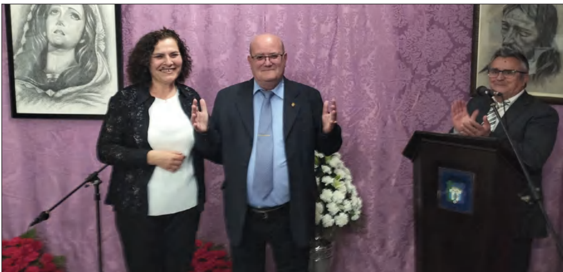
Agradecimiento de la Peña Recreativa Palestina al pregonero.