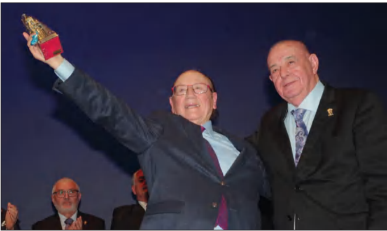
Homenaje a Fosforito.