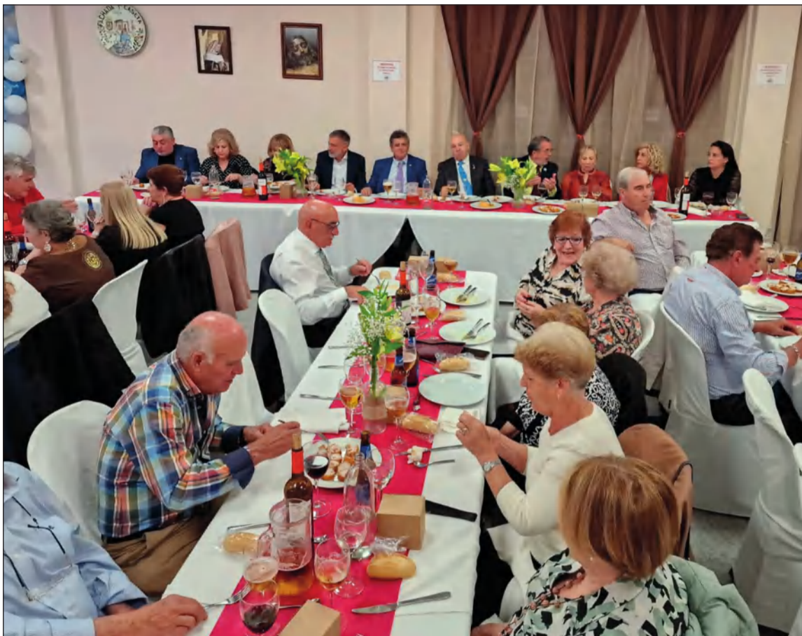
Celebración del Aniversario de la Peña Tiro Pichón, que tenía lugar el sábado 23 de marzo en su sede.