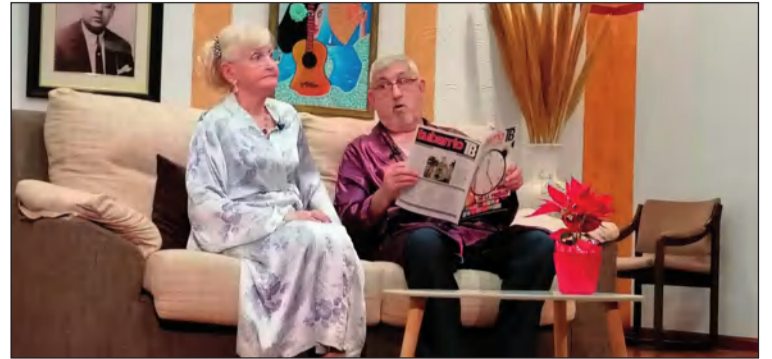
Un momento de la representación teatral.

con obras del mismo autor, que contará como siempre con el apoyo de la Federación Malagueña de Peñas.