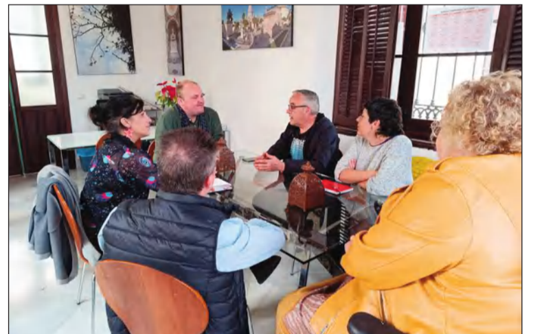
Reunión con los componentes de 'Con Málaga'.