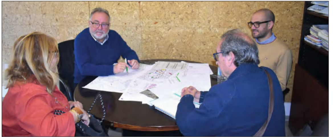
Ambas entidades federadas trabajan junto al Ayuntamiento de Alhaurín de la Torre en un gran Festival de Folclore.