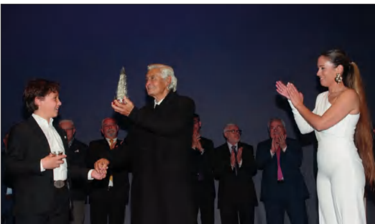
Barquerito, junto a su nieto y su hija.