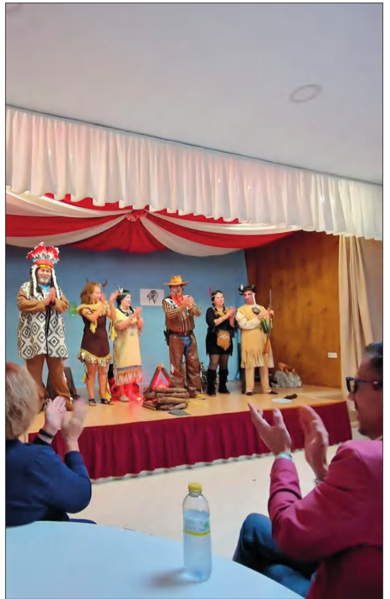
Ovación final a los actores.