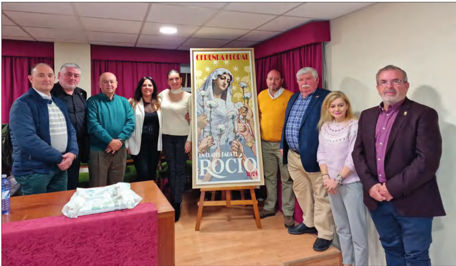
Participantes en la última sesión del Curso de Saetas en la Casa Hermandad de El Rocío, con la presencia de su hermano mayor.