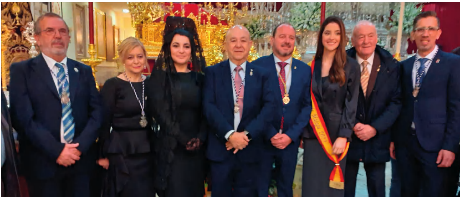
La Federación Malagueña de Peñas participaba un año más en la Ofrenda Floral 'Un Clavel para el Rocío', organizada desde esta cofradía de la que el colectivo es Hermano Mayor Honorario.

Web: www.femape.com Edición digital: www.femape.com/la-alcazaba-periodico X: @FMPLaAlcazaba Facebook: FMPLaAlcazaba