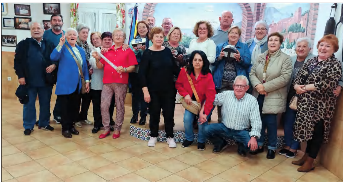
Participantes en el campeonato tras la entrega de premios a las parejas ganadoras.

Desde esta entidad integrada en la Federación Malagueña de Peñas se destaca que hubo un buen ambiente.