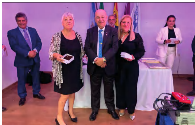
Entrega de los premios de los Juegos Recreativos.

En el transcurso de este acto se hacía entrega también de los premios de los Juegos Recreativos desarrollados en la entidad.