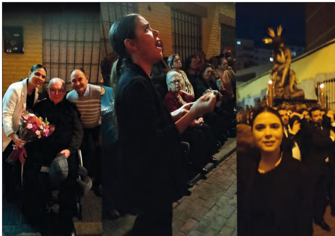
Tres instantes del Traslado de Humildad y Paciencia a su paso por la sede de la Peña San Vicente.

La entronización del Santísimo Cristo de la Humildad y Paciencia puso el broche a una noche maravillosa en la que acompañó la Banda Música de Cruz de Humilladero.