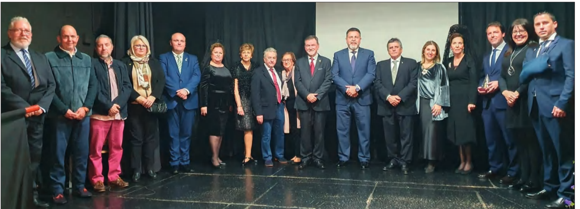
Imagen de grupo a la conclusión de la Exaltación de la Mantilla de la Peña El Sombrero.

Este acto tenía lugar en el salón del Centro Ciudadano Antonio Sánchez Gómez de Nueva Málaga, hasta donde se desplazaron numerosos socios; entre ellos una amplia presencia de señoras luciendo la Mantilla Española.