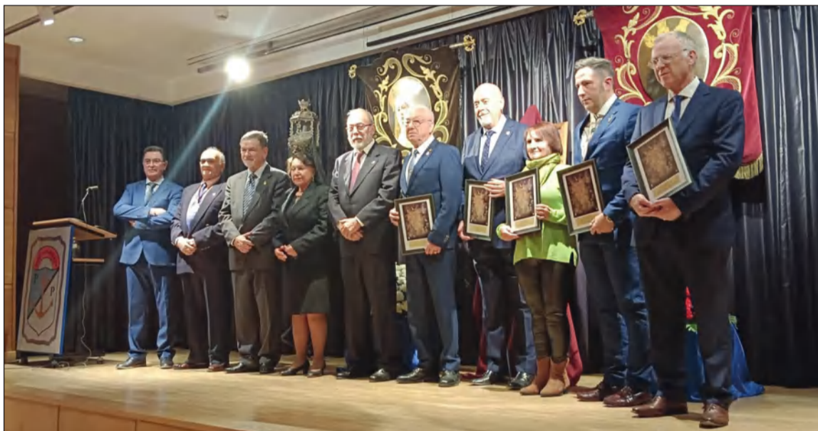
Asistentes al Pregón organizado por la Peña Perchelera.

Además, la entidad ha vivido unas emotivas vísperas, con el paso por su sede de los traslados de la Expiración y la Misericordia.