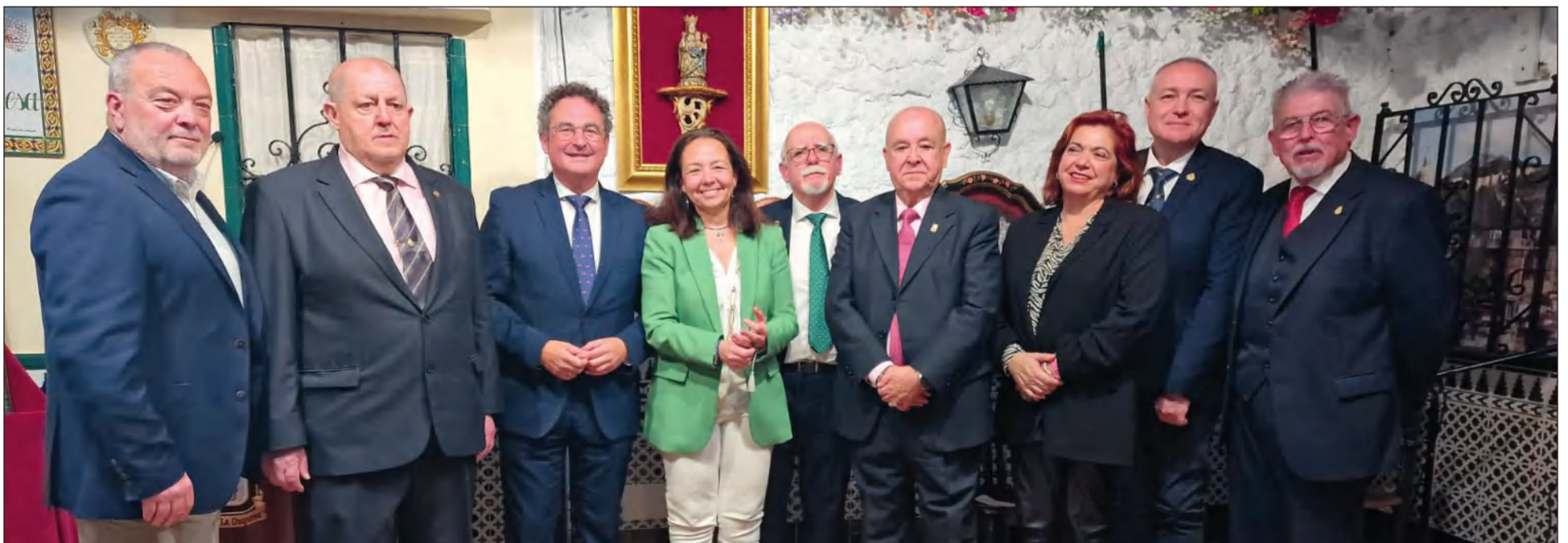
Participantes en el acto cofrade celebrado en Cortijo La Duquesa.