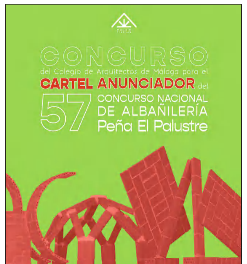
Convocatoria del concurso.