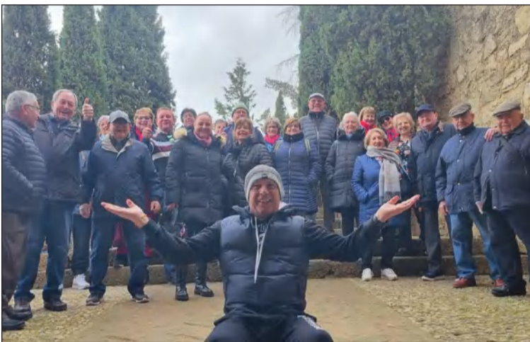
Socios de la entidad en la Alcazaba de Antequera