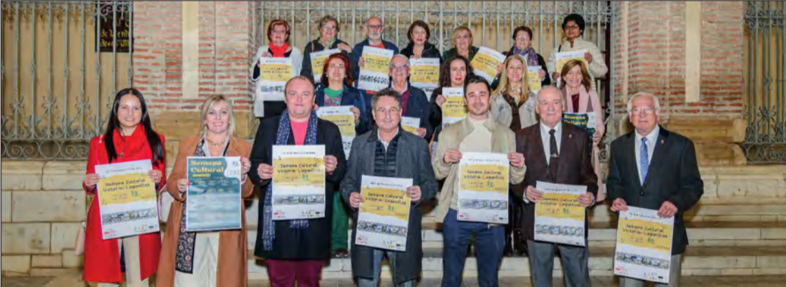
Presentación del cartel de la Semana Cultural.