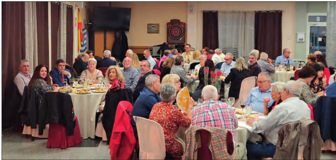
Socios de la Peña Tiro Pichón disfrutaban del Día de los Enamorados.