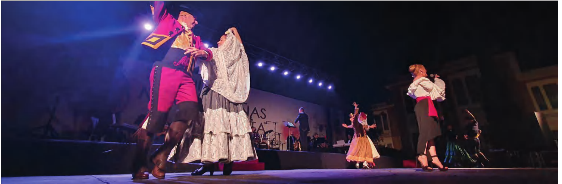
El cante y el baile se fusionan en el Certamen de Malagueñas de Fiesta, por lo que es importante la participación de todos sus actores en la reunión de este martes.

• FEDERACIÓN MALAGUEÑA DE PEÑAS, CENTROS CULTURALES Y CASAS REGIONALES 'LA ALCAZABA'