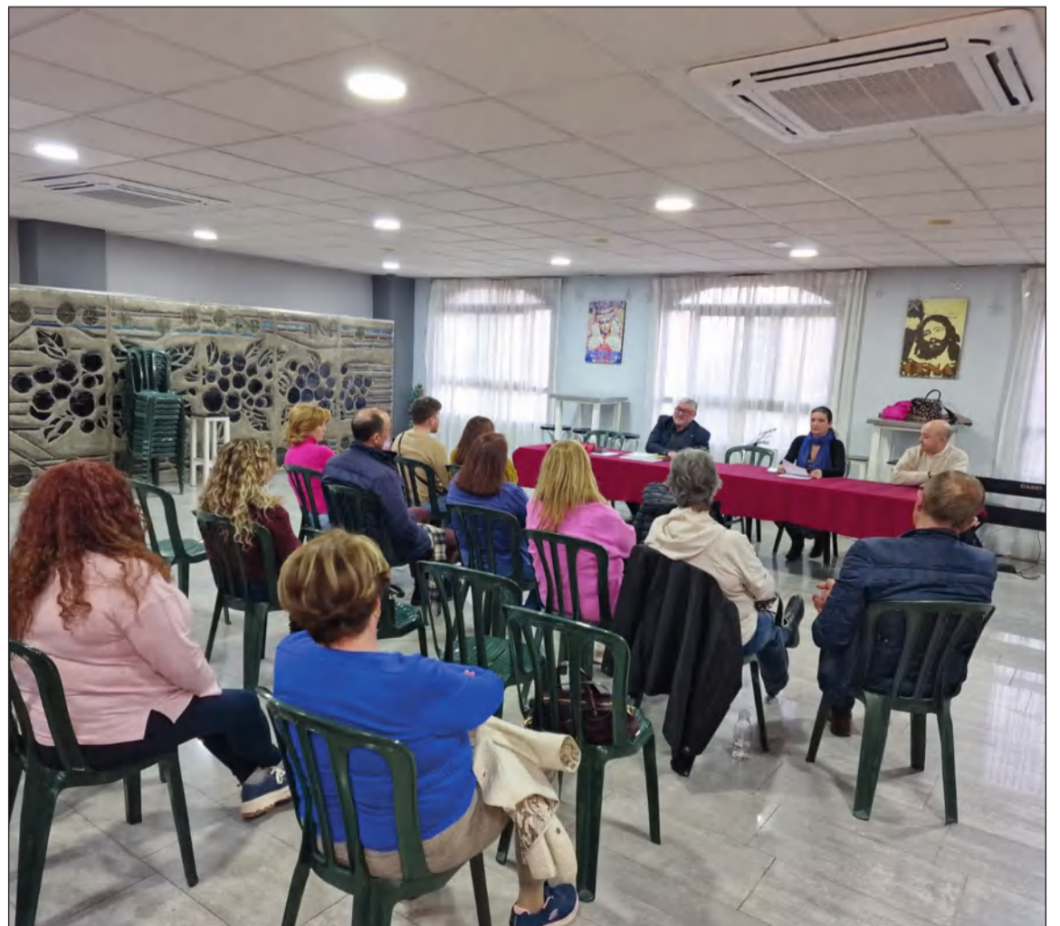
Primera sesión del Curso de Saeta Malagueña 2024 en la Casa Hermandad de la Sagrada Cena.