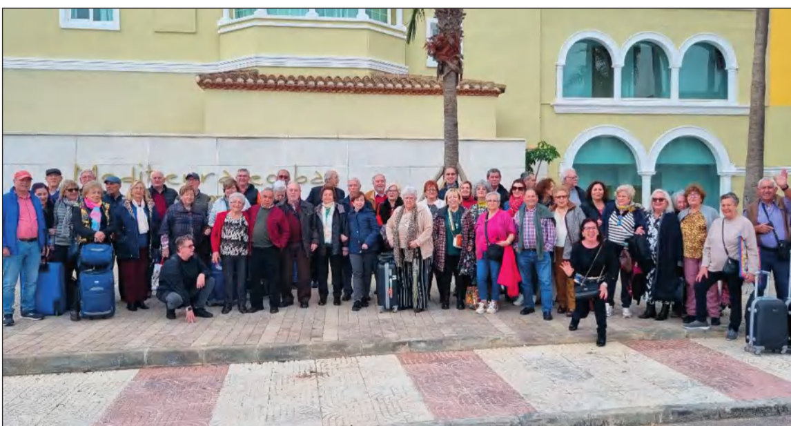
Socios en el exterior del hotel donde se alojaron.