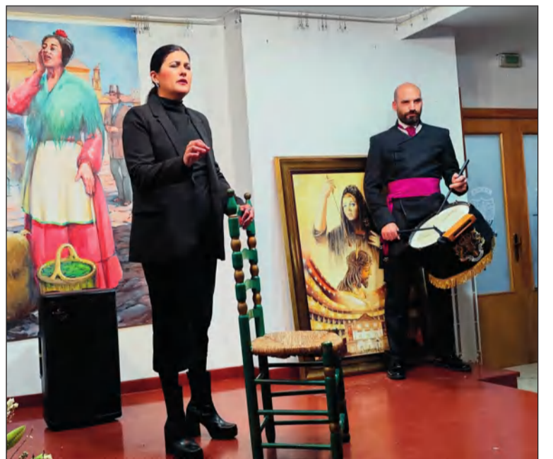
El Concurso de Saetas regresaba a la sede de la Peña Trinitaria.