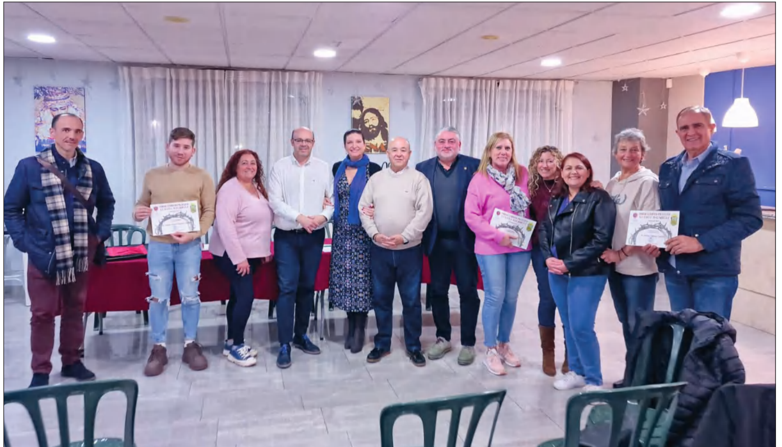
Entrega de diplomas a algunos de los alumnos que realizaron el curso el pasado año.