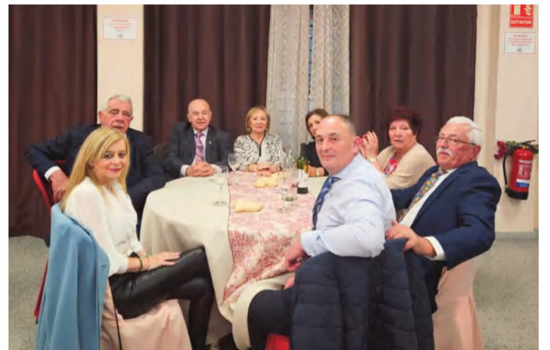
Componentes de la Federación Malagueña de Peñas.