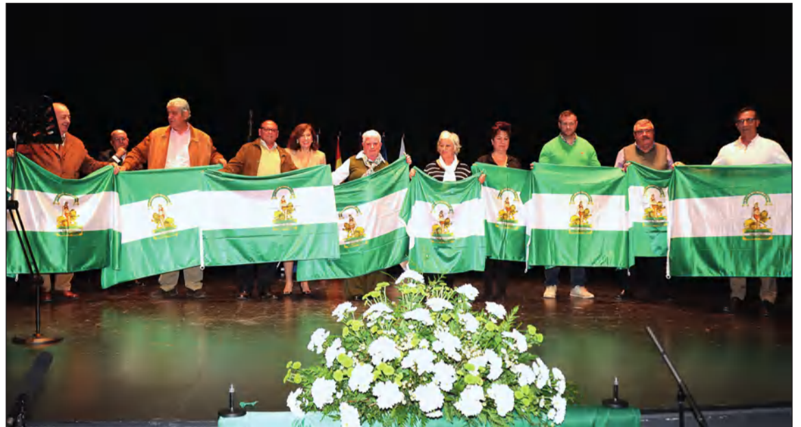
Entrega de banderas de Andalucía en el acto celebrado el 28 de febrero del pasado año.

Quedan todos invitados a este acto, disfrútenlo y sientan el orgullo de ser andaluces. Sean conscientes de que somos unos privilegiados de haber nacido en esta tierra, y que también somos responsables de que siga siendo un autentico paraíso como lo es en la actualidad.