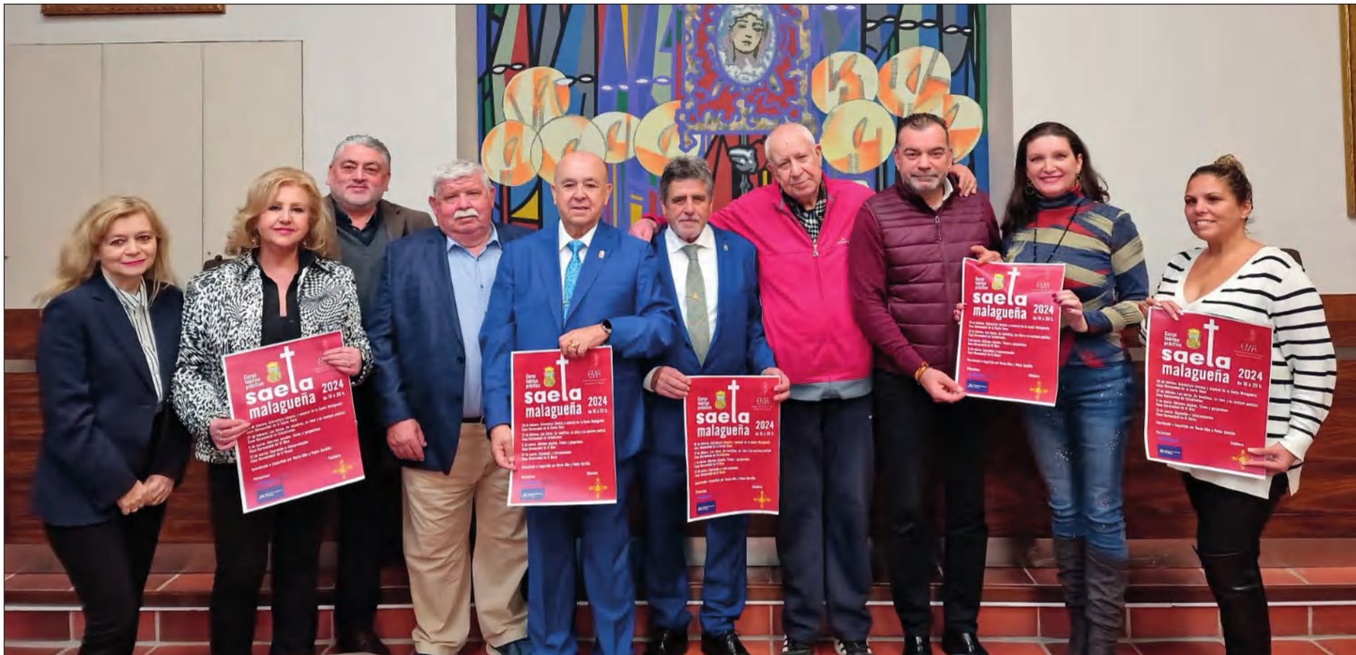
Presentación de este Curso Teórico - Práctico en la sede de la Agrupación de Cofradías de Semana Santa de Málaga.

• FEDERACIÓN MALAGUEÑA DE PEÑAS, CENTROS CULTURALES Y CASAS REGIONALES 'LA ALCAZABA'