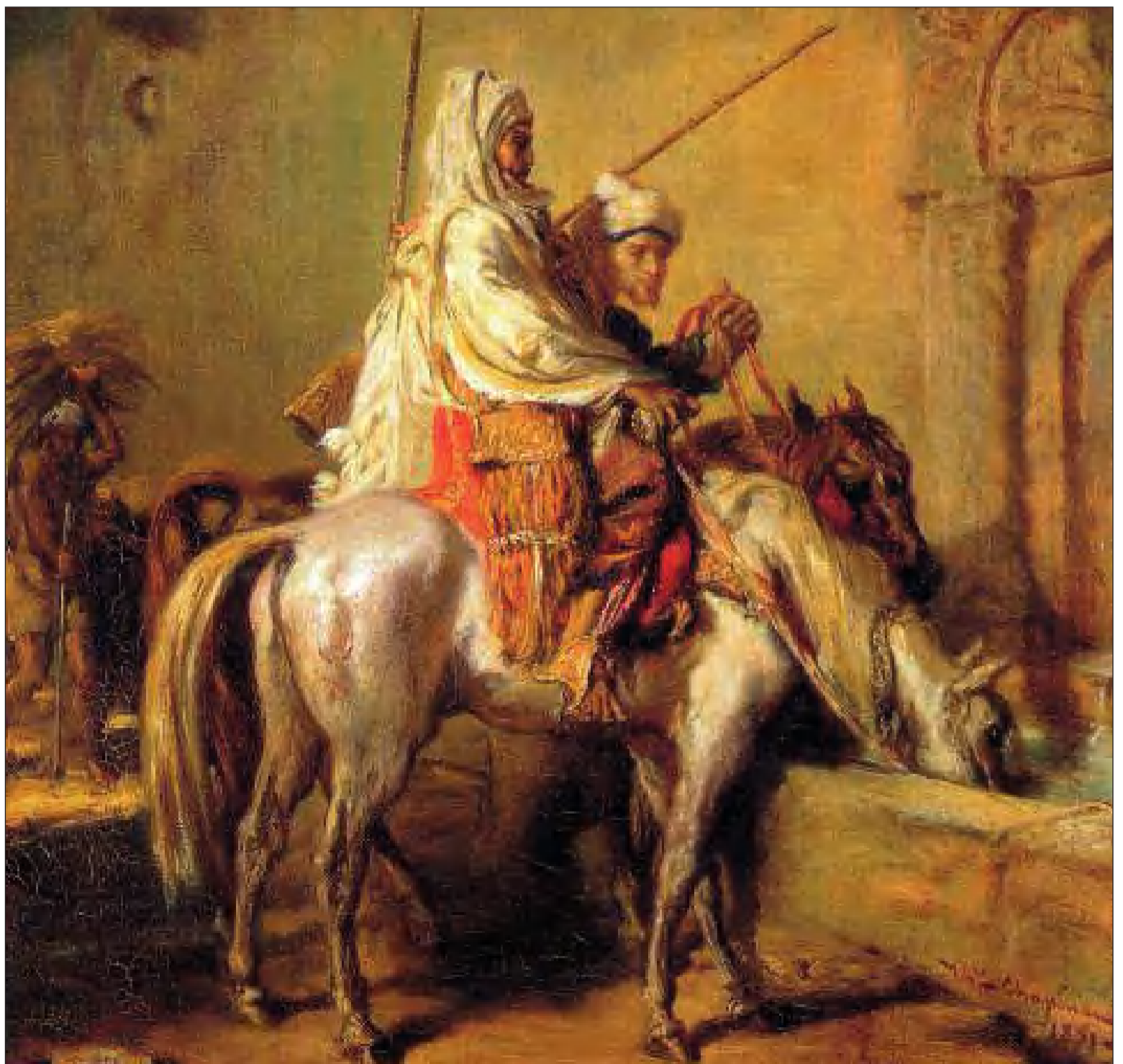
Ilustración la época.

Ismael vivió junto a don Diego por el resto de sus días, y participaron juntos en el rescate de esclavos y en todas las obras de caridad y justicia que emprendieron a lo largo de sus vidas.