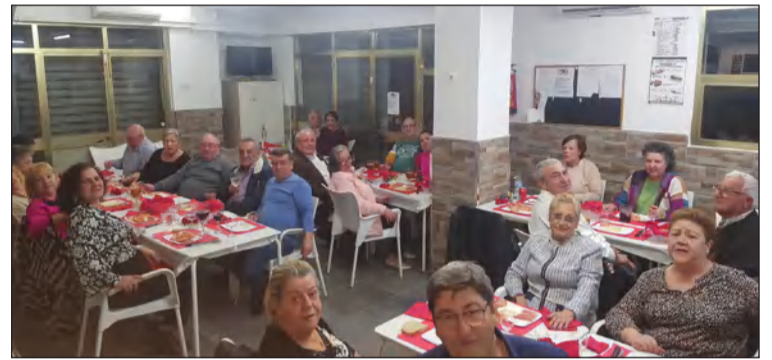
Vista general del salón durante esta actividad.