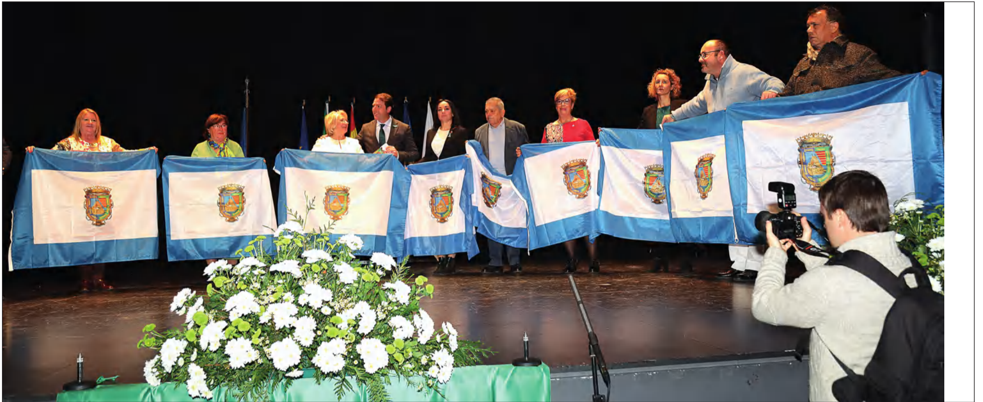
Entrega de las banderas correspondientes a la Diputación Provincial de Málaga en la edición 2023 del Día de Andalucía.

• FEDERACIÓN MALAGUEÑA DE PEÑAS, CENTROS CULTURALES Y CASAS REGIONALES 'LA ALCAZABA'