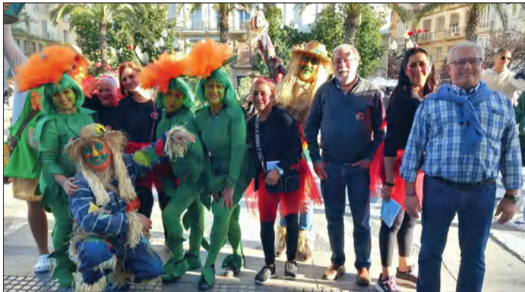
Socios de la Peña Perchelera disfrutaban del Carnaval de Cádiz.