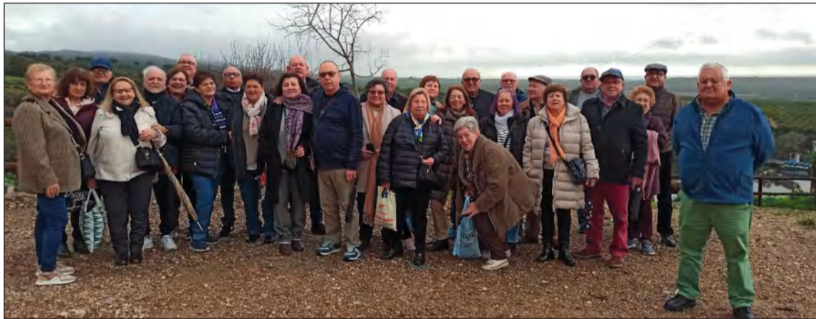
Imagen de grupo tras realizar un recorrido en barco por Hornachuelos.

'La Alcazaba' disfrutaron de estos días, con alojamiento en un hotel de la capital cordobesa donde disfrutaron de una muy buena estancia y una comida excelente.