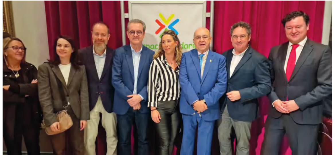
La Federación Malagueña de Peñas era invitada a participar en esta presentación.

El programa de este espacio abordará muy diferentes temáticas a lo largo de las ocho jornadas de actividad, con temas como la soledad, la violencia, el suicidio, el medio ambiente, la infancia o la tercera edad.