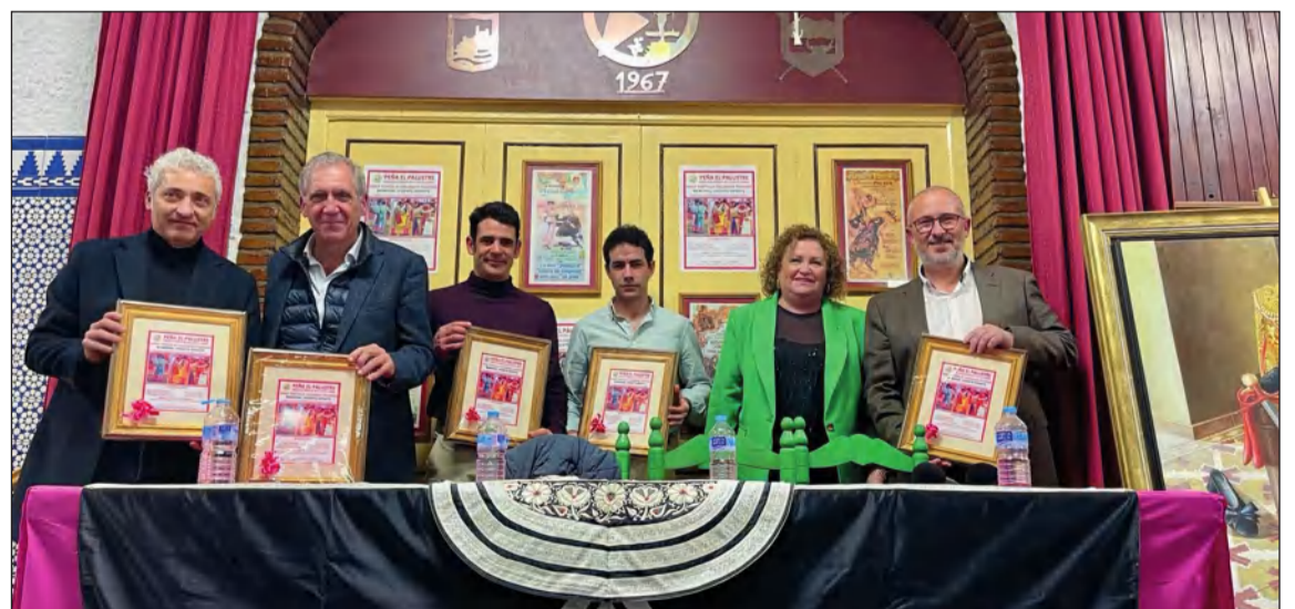
Entrega de recuerdos a los participantes en la tertulia taurina.