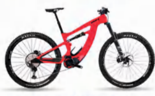
BICIS ELÉCTRICAS DE MONTAÑA