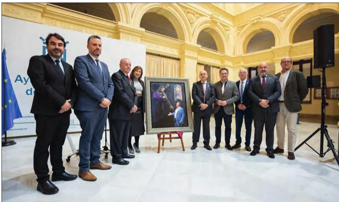
Presentación del Concurso Nacional de Saetas en el Ayuntamiento de Málaga.