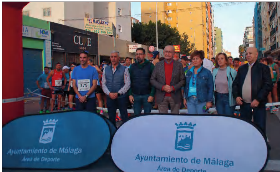
El alcalde era el encargado de cortar la cinta de salida.