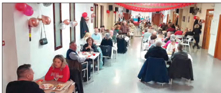
Cena de enamorados en la sede de la peña.

Por otra parte, se anuncia la celebración de un acto por el Día de Andalucía el 28 de febrero, con actuaciones y actividades lúdicas, así como una comida de hermandad.