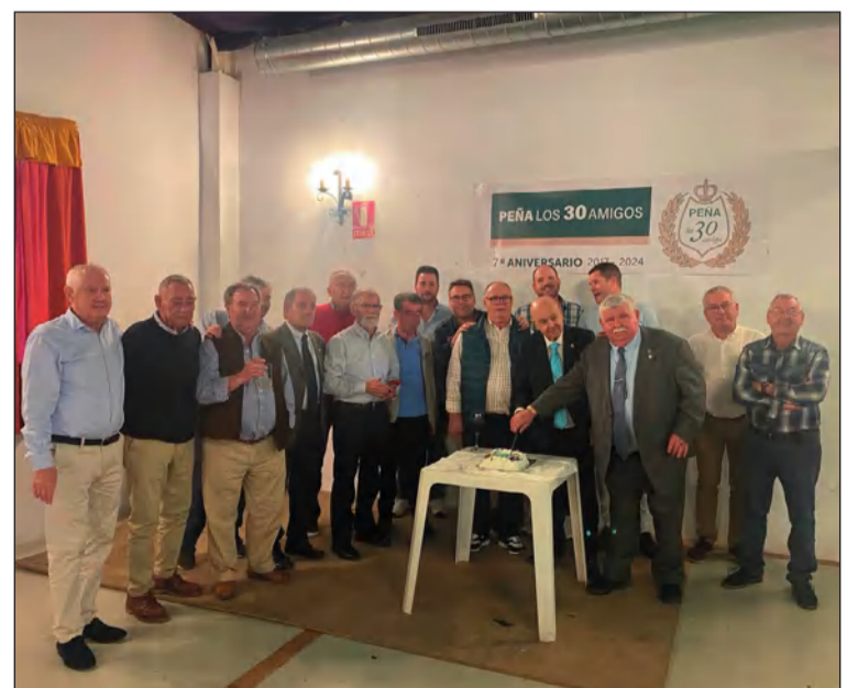
Corte de la tarta conmemorativa del aniversario de la entidad.