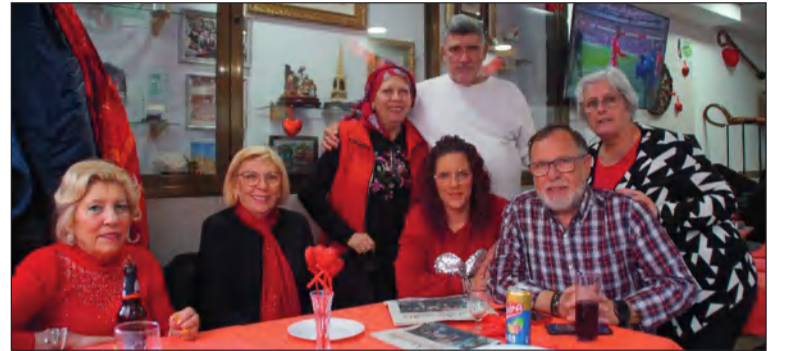
Socios disfrutan de esta celebración.