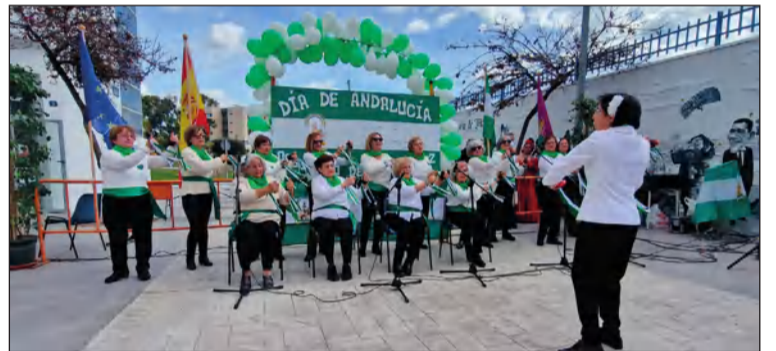
Grupo de Castañuelas, en una de las actuaciones.

Se sucedieron las actividades en una jornada en la que se contaba con la presencia del alcalde.