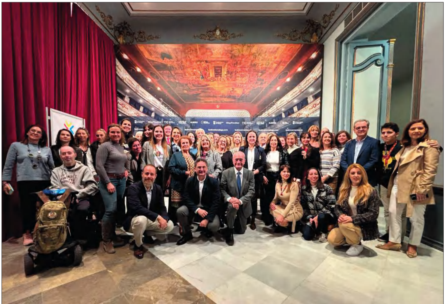
Representantes de los colectivos sociales participantes, con el alcalde y demás asistentes a la presentación de esta actividad.