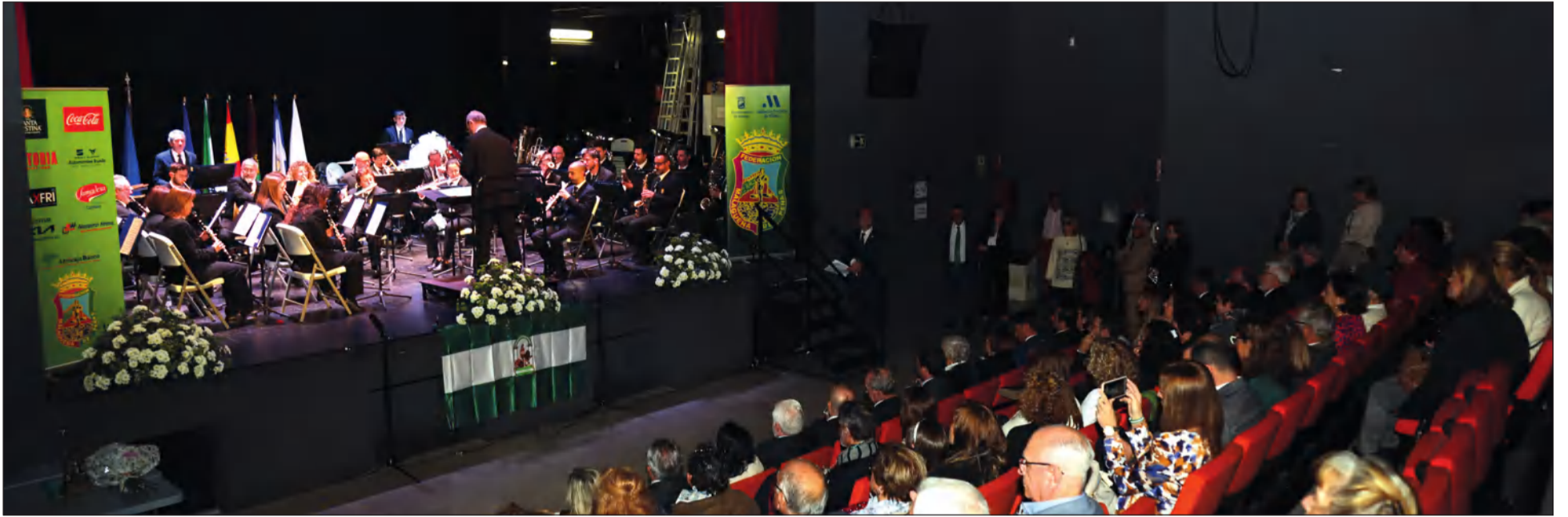
Actuación de la Banda Municipal de Música de Málaga en el Día de Andalucía 2023.

• FEDERACIÓN MALAGUEÑA DE PEÑAS, CENTROS CULTURALES Y CASAS REGIONALES 'LA ALCAZABA'