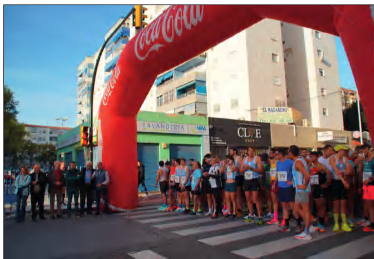
Inicio de la prueba desde calle Frigiliana.

Los más pequeños corrieron en la prueba de 2,8 kilómetros que tenía su salida en la plaza