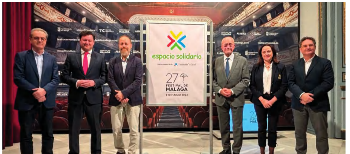
Autoridades, representantes del Festival y patrocinadores del Espacio Solidario.