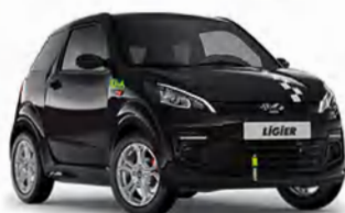
COCHES SIN CARNET

MÁLAGA Polígono San Luis | C/Carretería | C/Moraima | Av. Velázquez | C/María Tubau | Vélez-Málaga | Marbella | San Pedro de Alcántara