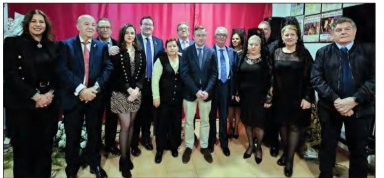
Asistentes a este acto, entre ellos el presidente de la Federación de Peñas.