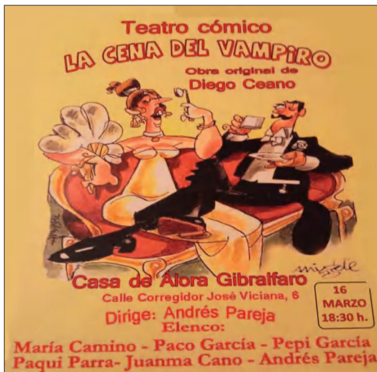
Cartel del espectáculo.

Por otra parte, la Casa de Álora Gibralfaro acoge en la tarde del próximo 16 de marzo la representación de la obra de teatro 'La cena del Vampiro', de Diego Ceano, bajo la dirección de Andrés Pareja.