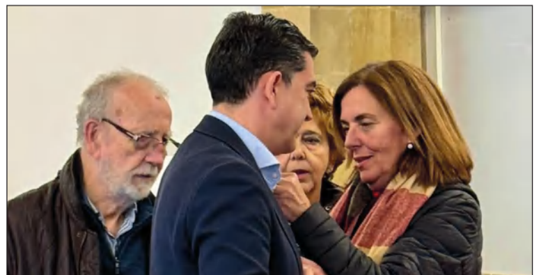
Imposición del escudo de la entidad al alcalde de Baeza.