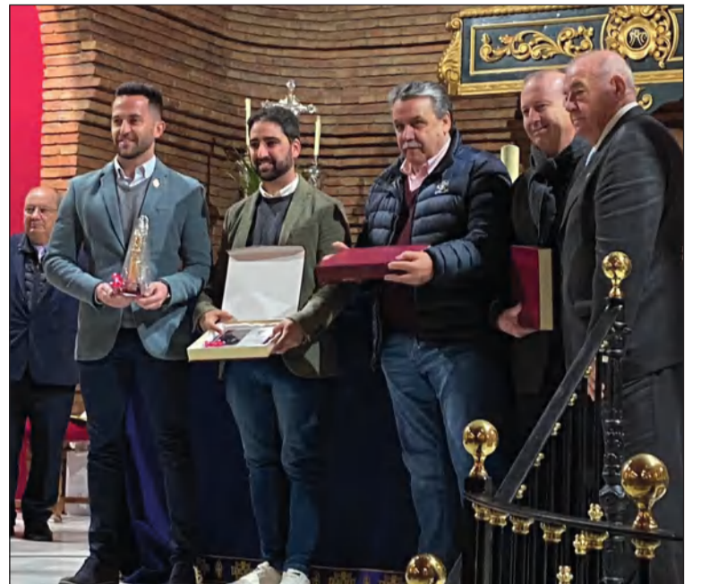
Primera fase selectiva en Arriate.