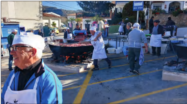
Fiesta de la Matanza de Ardales.