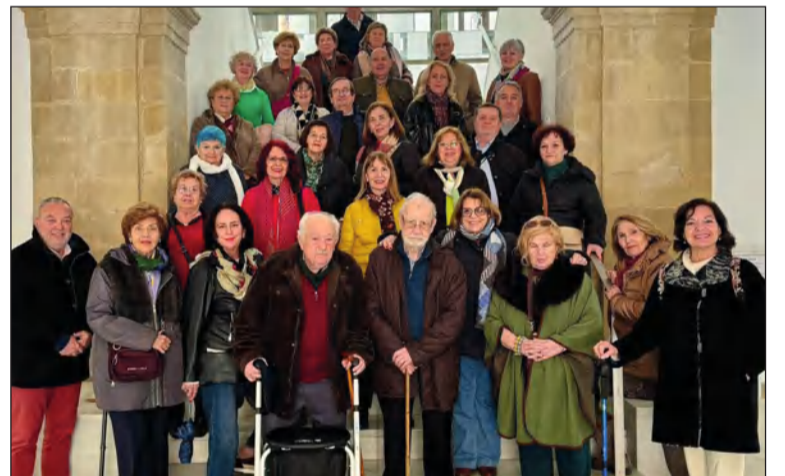
Socios participantes en esta actividad cultural.