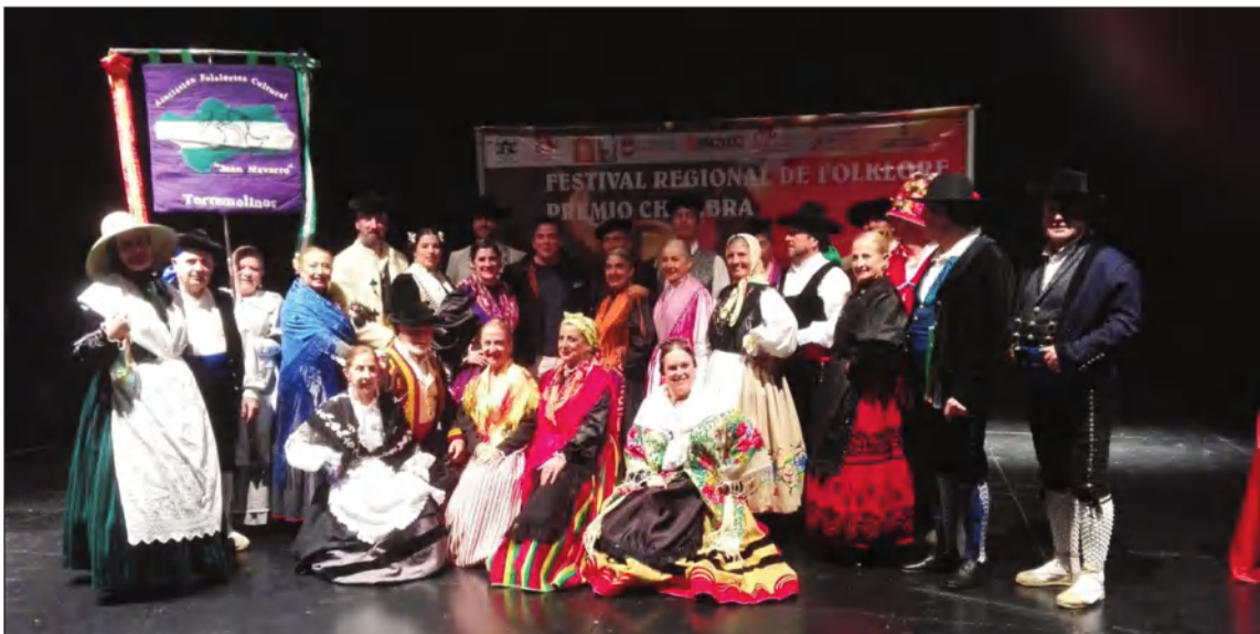
Integrantes de la Asociación Juan Navarro en Puertollano.

• ASOCIACIÓN FOLCLÓRICO CULTURAL JUAN NAVARRO