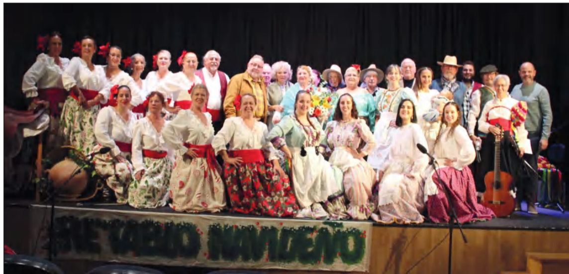
Imagen de grupo a la conclusión del espectáculo.