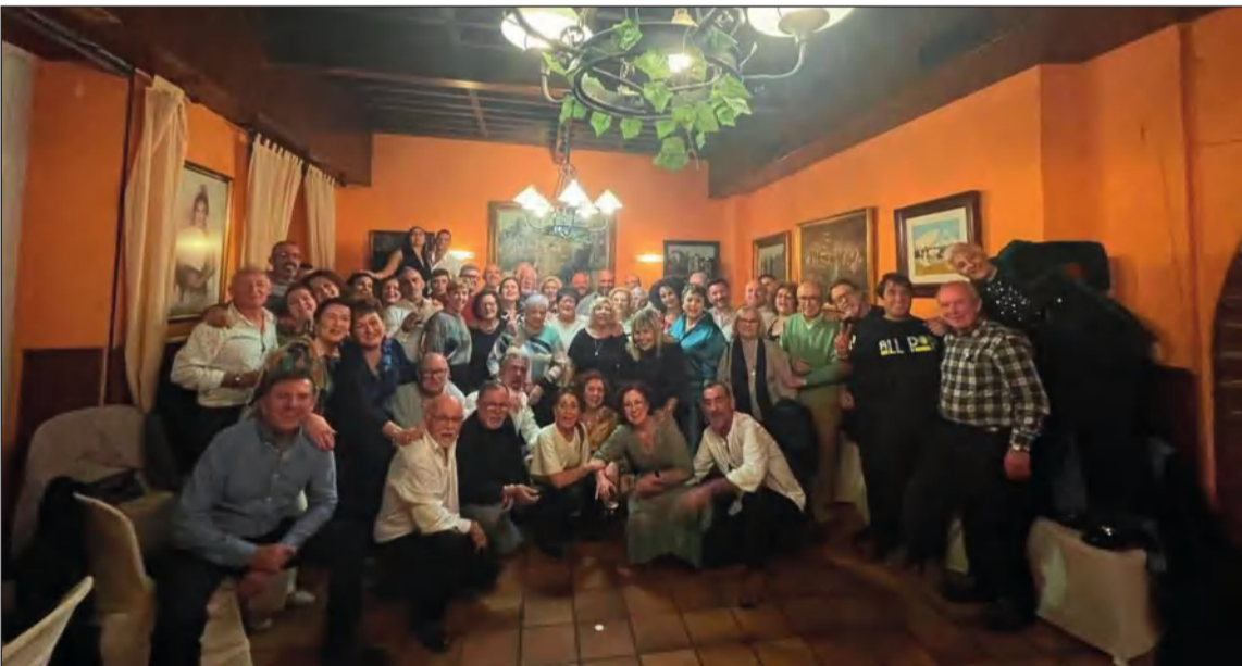
Imagen de grupo en el Aniversario de la Peña El Bastón.