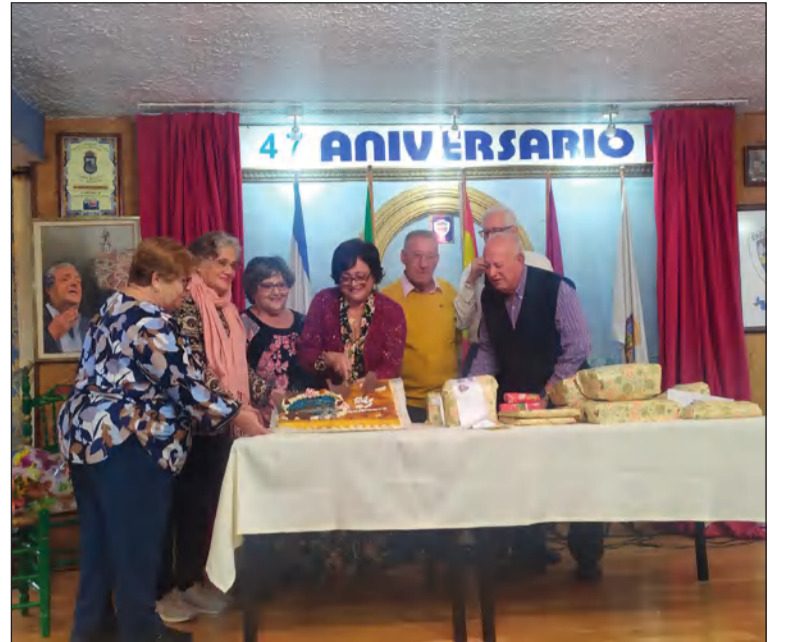
Corte de la tarta.

Los actos llegaban a su culmen el día 6 nuestro con un almuerzo de gala con la entrega de los premios de los juegos de salón ya celebrados, los