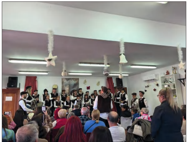
Actuación en el interior de la peña.