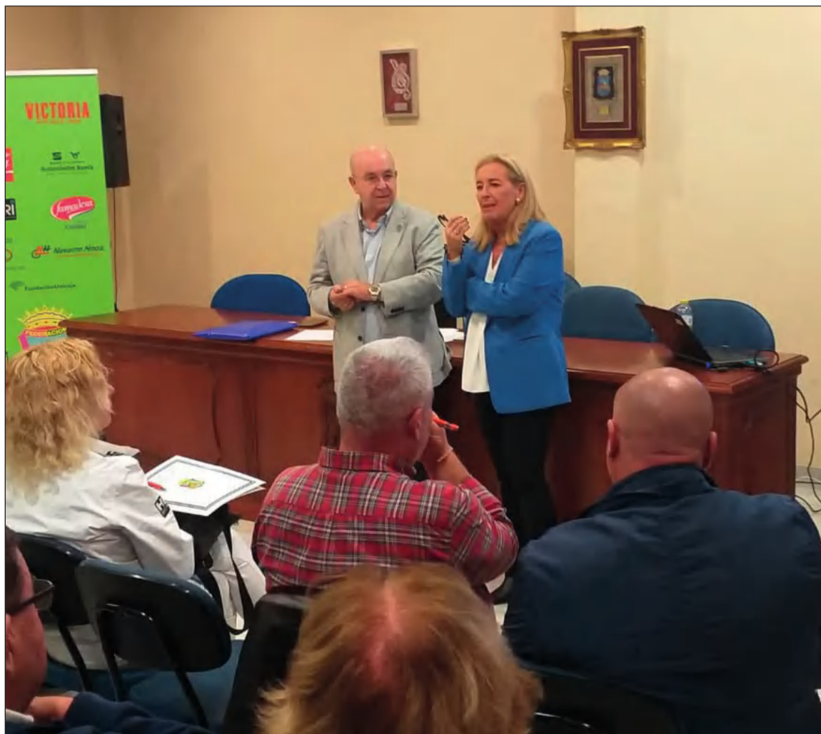
Un instante del desarrollo del Curso de Protocolo impartido en la sede de la Federación Malagueña de Peñas.

organizaba en su sede un Curso de Protocolo en la jornada del pasado miércoles 29 de noviembre.