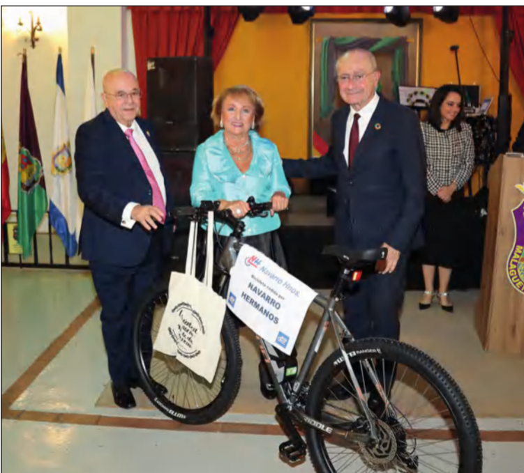
Navarro Hermanos donó una bicicleta eléctrica para sortear en los peñas.