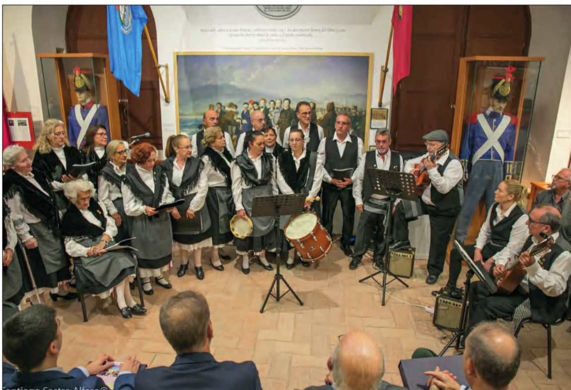
Actuación de Solera en las Jornadas de la Asociación Histórico Cultural Torrijos.

En la presentación de la actuación, se anunciaba que se va a trabajar de cara al 35 aniversario de la Asociación Folclórico Cultural Solera con la creación de un musical Solera-Torrijos.