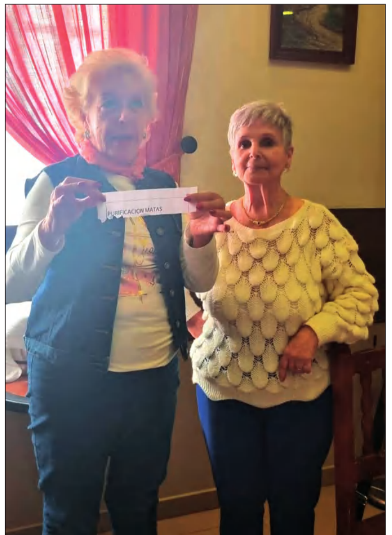
Ganadoras de éste y el próximo viaje de la Peña Nueva Málaga.

Como en cada uno de las excursiones que realizan, sortearon un nuevo viaje para el próximo desplazamiento.