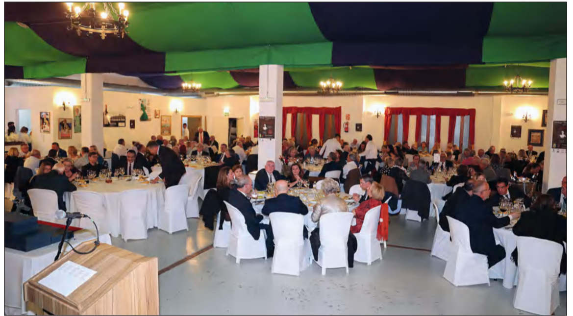
Vista general de la Caseta de la Federación durante la celebración del XLII Aniversario.

La fiesta continuaba con música y baile en directo, a cargo de la Orquesta Ritmo Andaluz Show.