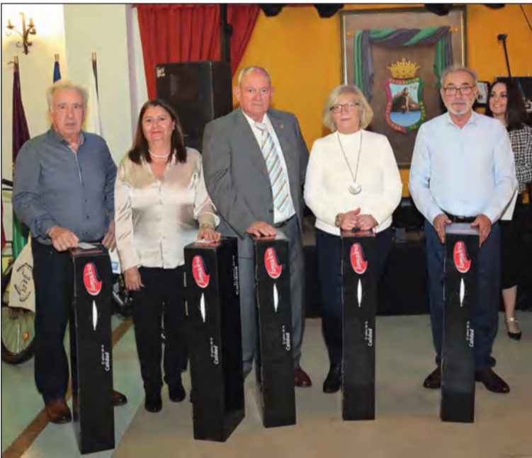
Ganadores de los cinco jamones sorteados de Famadesa.