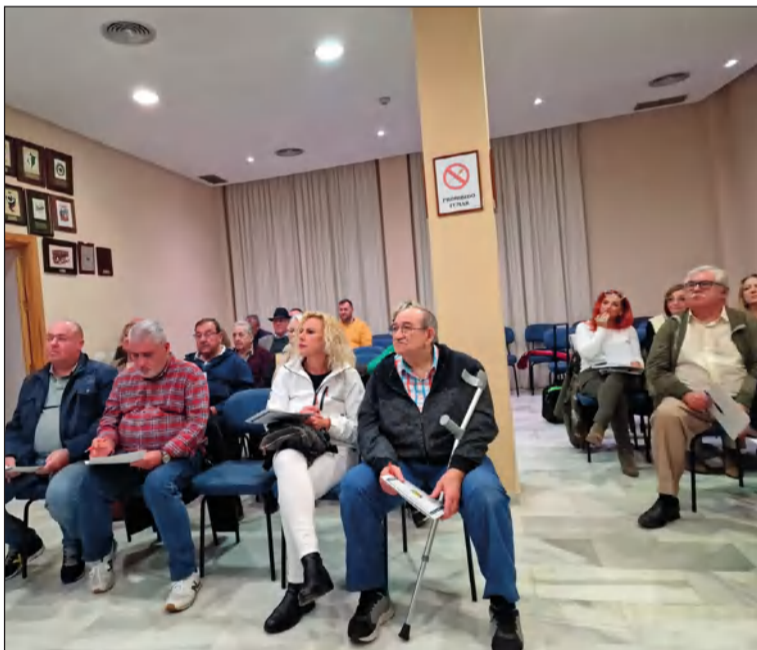
Algunos de los asistentes al curso.