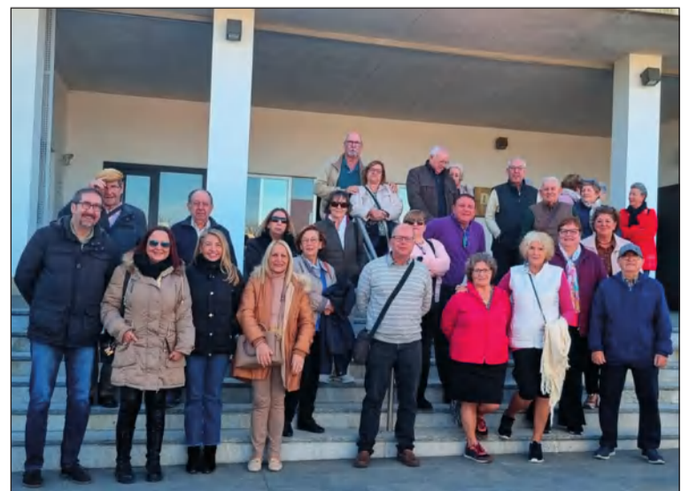
Participantes en la excursión a Mollina y Antequera.