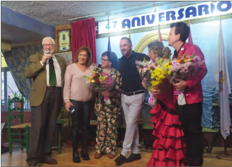
Agradecimiento a los artistas participantes.