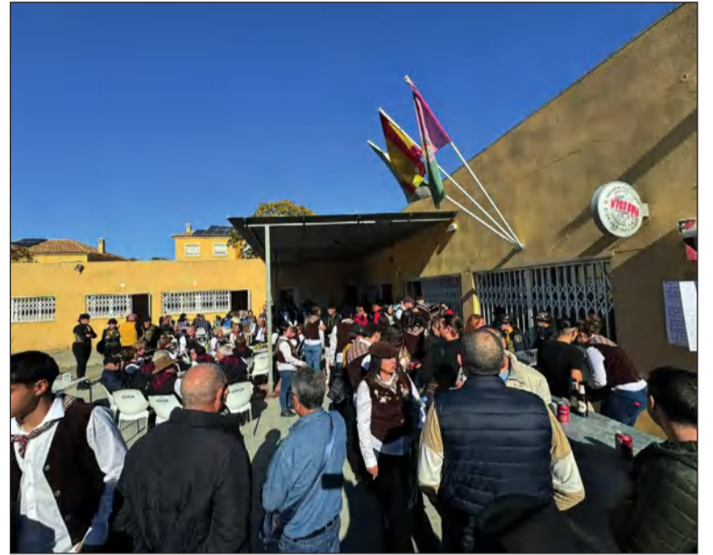
Gran ambiente en el exterior de la sede.