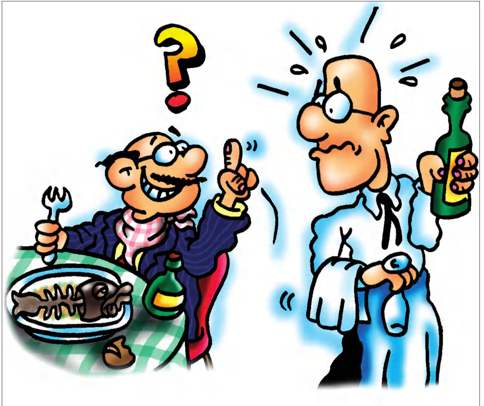
Ilustración de Enrique García.

Uno de los invitados que se encontraba sentado junto al ministro y que no había tenido la gran dicha de nacer en tan afortunada cuna marinera y malagueña, al ver y al comprobar lo delicioso que ésta "Japuta" estaba, preguntó a uno de los camareros por el nombre de tan exquisito pez. El camarero quería corresponder al requerimiento de tan digno comensal, pero no sabía cómo decirle el nombre del pescado, sin que le tomaran por un soez empleado. A la sazón se percató de que el ministro había oído la pregunta y miraba a ambos. El camarero se