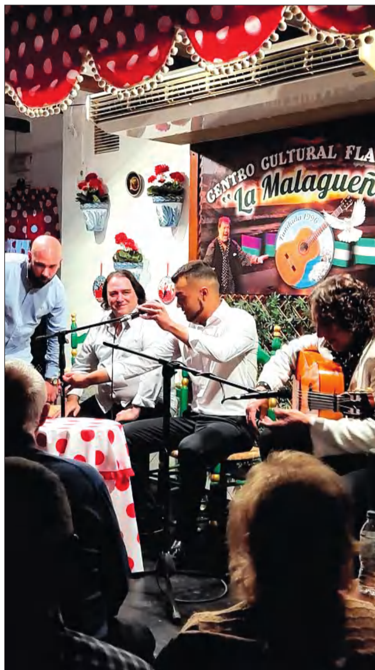
Actuación en el Centro Cultural Flamenco 'La Malagueña'.