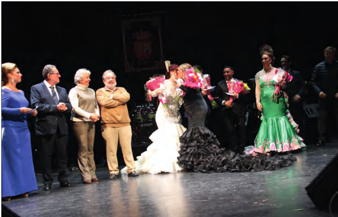
Acto de entrega de premios del Memorial Juan Luis Molina Granero.

La Escuela de Cante y Copla 'Miguel de los Reyes' de la Federación Malagueña de Peñas ha querido expresar públicamente la satisfacción porque una de sus alumnas haya logrado este prestigioso certamen de canción española, no ya solo a nivel local, sino también nacional.