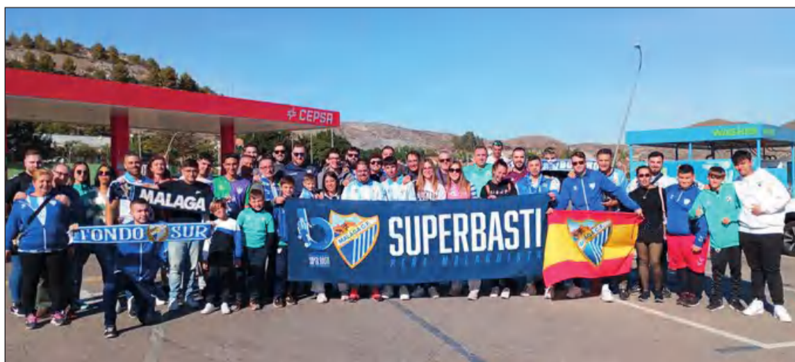
Grupo de desplazados hasta Murcia con la Peña SuperBasti.

entidad perteneciente a la Federación Malagueña de Peñas, Centros Culturales y Casas Regionales 'La Alcazaba'.