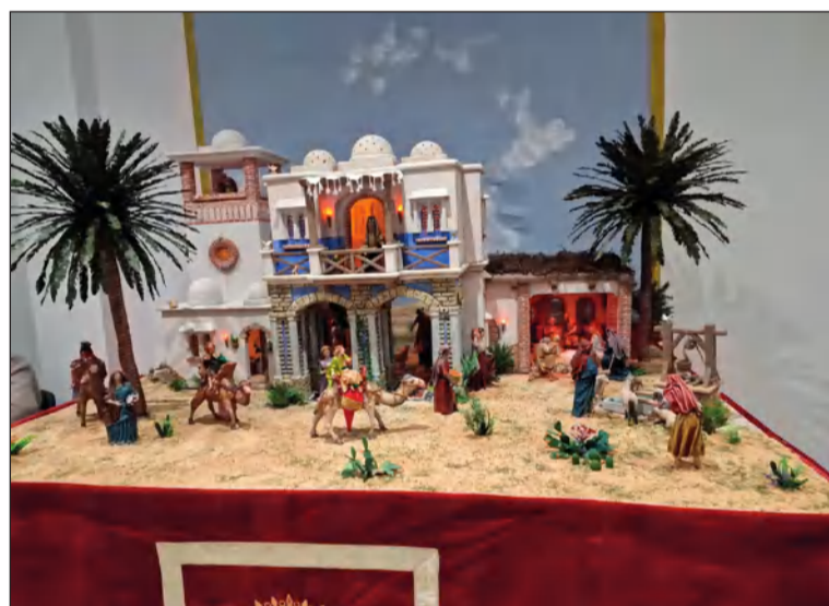
Belén de la Federación 2023.