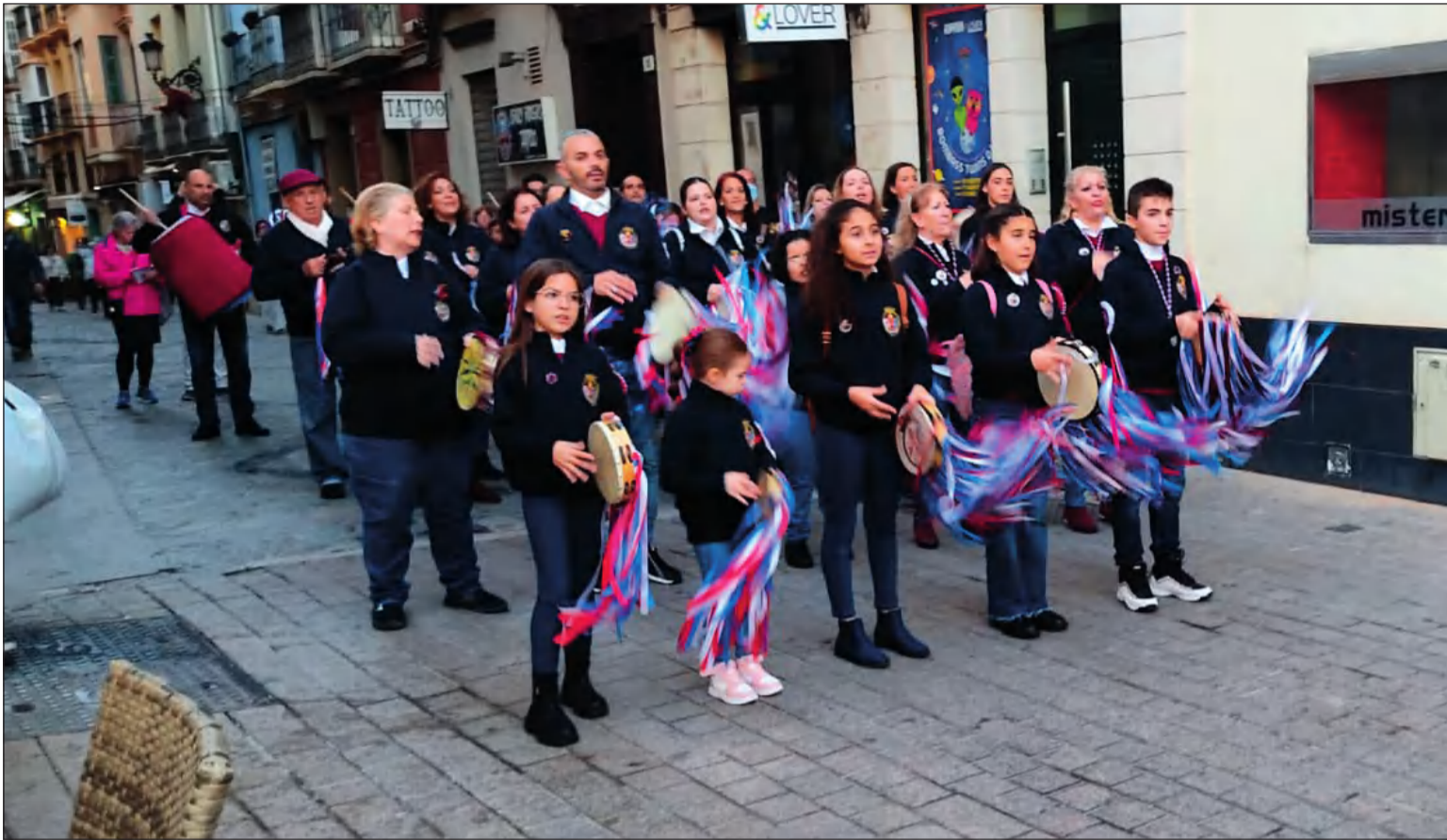
Una de las pastorales participantes en el Certamen del pasado año, durante el Pasacalles hasta el Teatro Cervantes.

• FEDERACIÓN MALAGUEÑA DE PEÑAS, CENTROS CULTURALES Y CASAS REGIONALES 'LA ALCAZABA'