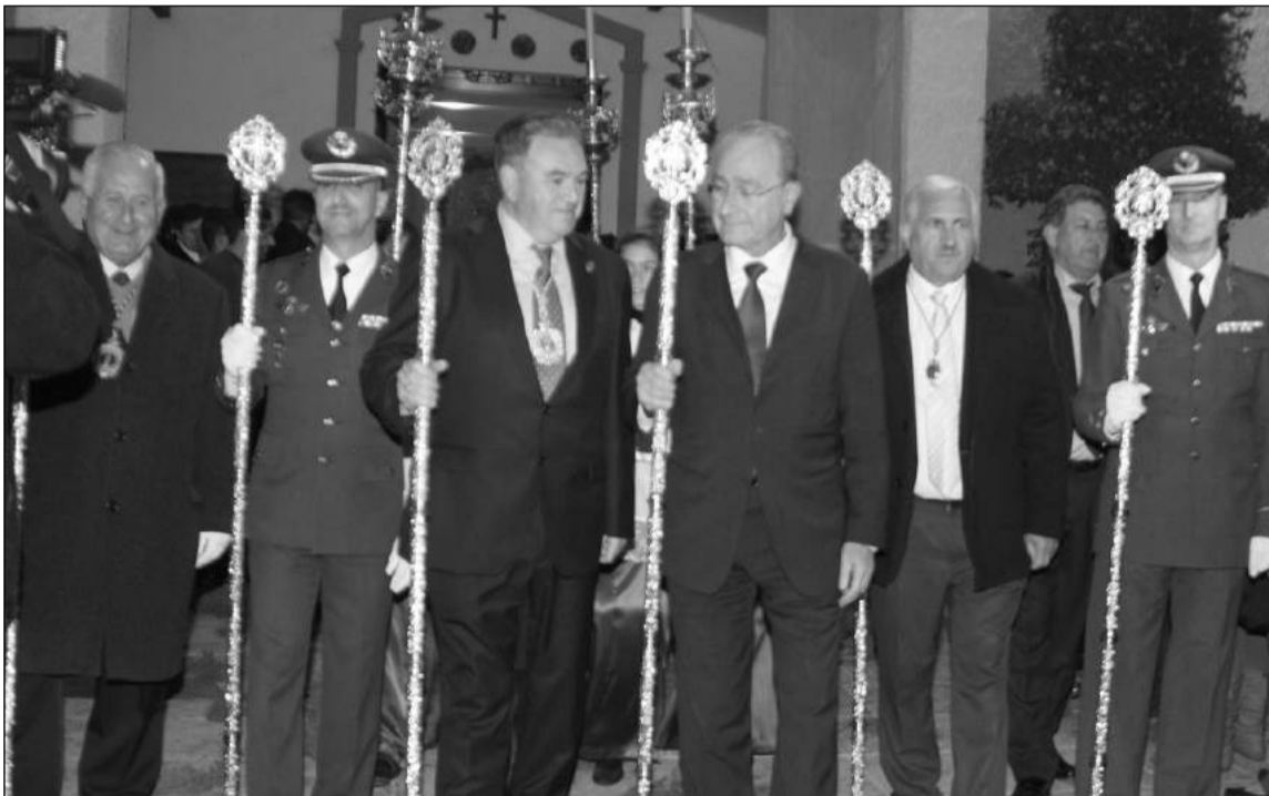
Autoridades civiles y militares en la presidencia de la procesión.