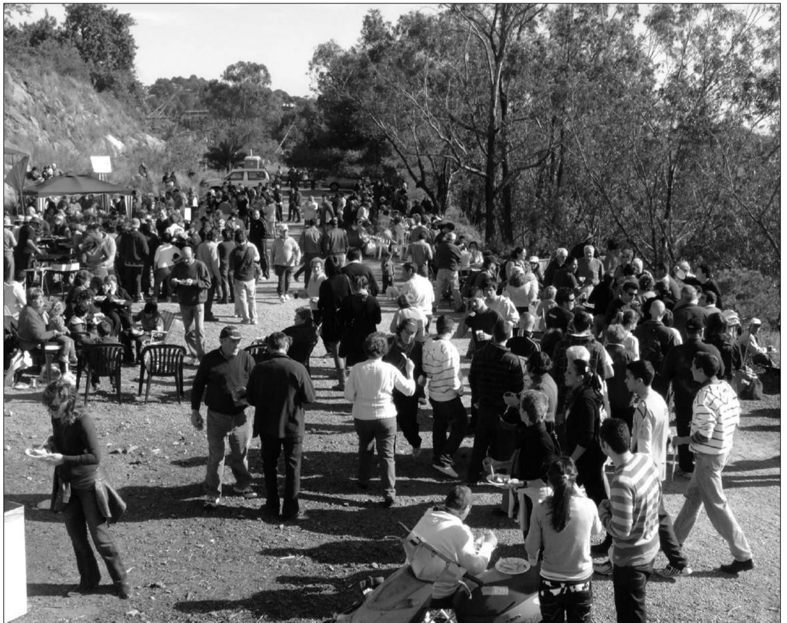
Imagen de archivo de la Romería de San Antón.