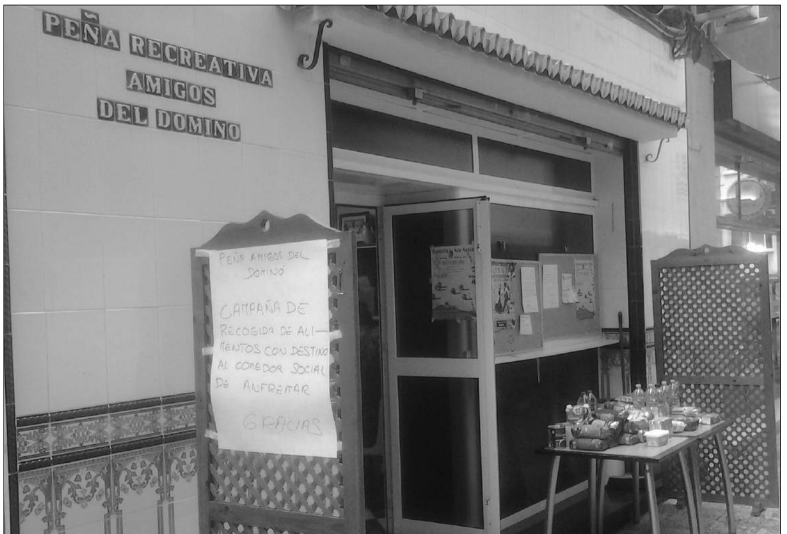
Mesa petitoria instalada en la puerta de la sede de la entidad.