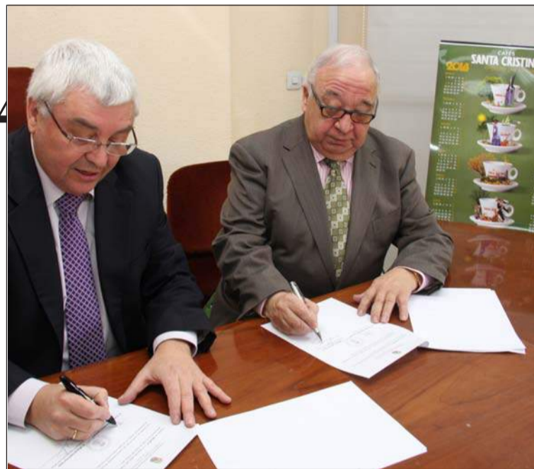
Instante de la firma del convenio.