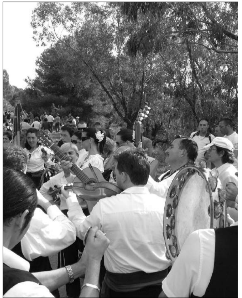
Una panda de verdiales, en una edición anterior.

No es la primera ocasión que la Romería de San Antón se ve alterada por las adversas condiciones meteorológicas. El año pasado, sin ir más lejos, tuvo que ser suspendida en la misma mañana en que estaba programada por las fuertes rachas de viento que azotaban el lugar de celebración de esta actividad tan popular entre los peñistas y vecinos en general de la barriada de El Palo.