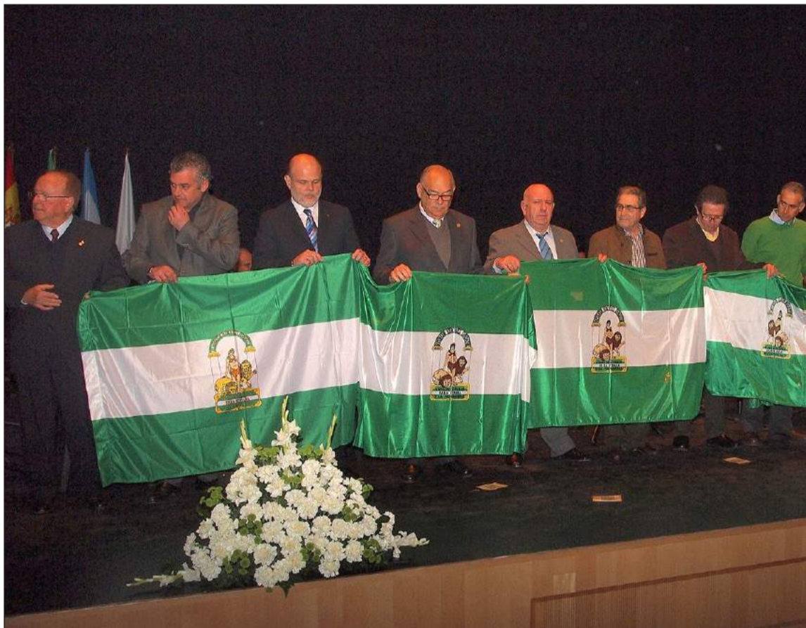
Entrega de banderas de Andalucía el pasado año.