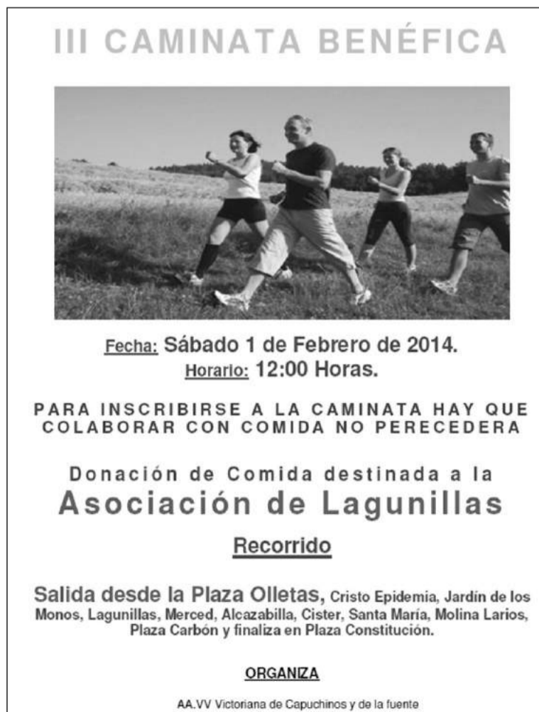
Cartel de la prueba.

La Asociación de Vecinos Victoriana de Capuchinos y la Fuente va a celebrar este sábado