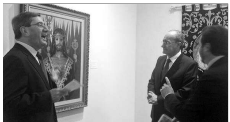
La Soledad de Mena, en su trono procesional.

La muestra ubicada en el Museo Revello de Toro, en la Casa-taller de Pedro de Mena, acoge un total de 70 obras correspondientes al periodo 1942-2004, seleccionadas de las piezas originales, que el artista realizó a lo largo de más de 70 años.