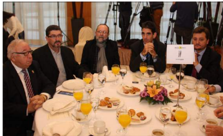
El presidente de la Federación de Peñas, a la izquierda de la imagen.

En clave local, De la Torre situó a Málaga dentro de este escenario de recuperación, algo que corroboran los datos con los que ha cerrado 2013, con nueve millones y medio de turistas en la provincia o los trece millones de viajeros registrados por el aeropuerto de la capital, además de las buenas cifras de la agroindustria o el mercado inmobiliario, que "está experimentando inicios de cambio". Además, las previsiones para 2014 son buenas y la economía local podrá crecer un 1,5 por ciento, una cifra por encima de la andaluza