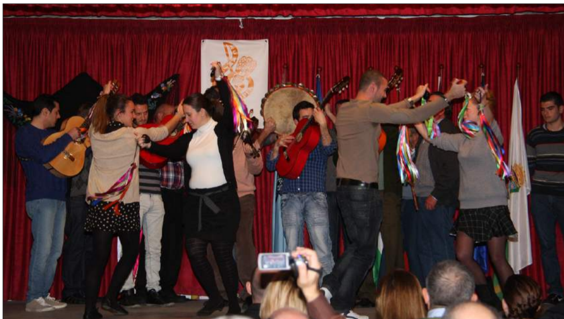
Verdiales en vivo en el escenario.