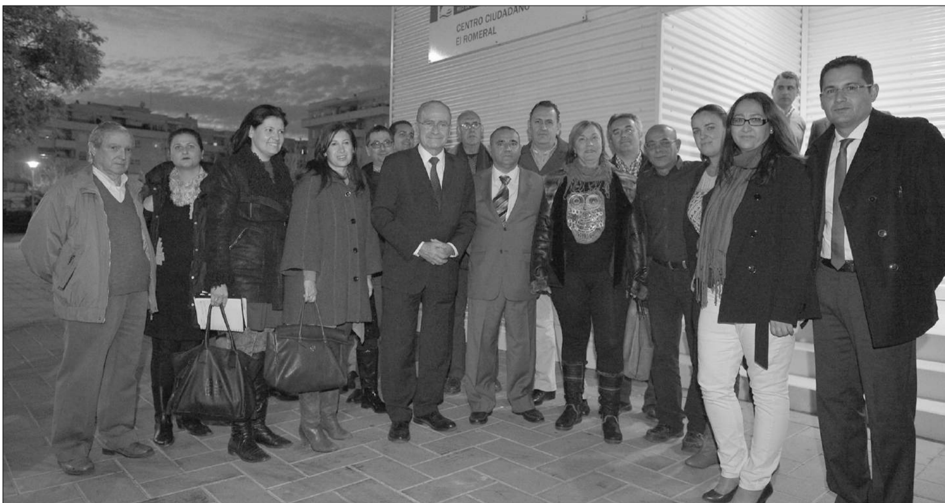
Asistentes a la inauguración, entre ellos una representación de la Federación Malagueña de Peñas.

Este centro lleva en funcionamiento dos años a disposición del movimiento asociativo de la zona. El edificio cuenta con una superficie útil de 452,84 m 2 distribuida en planta baja, primera planta y bajo cubierta. En la planta baja, con 248,31 m 2 , se ubican un despacho, salas para niños y niñas de 4 a 7 años en las instalaciones del Centro Ciudadano.