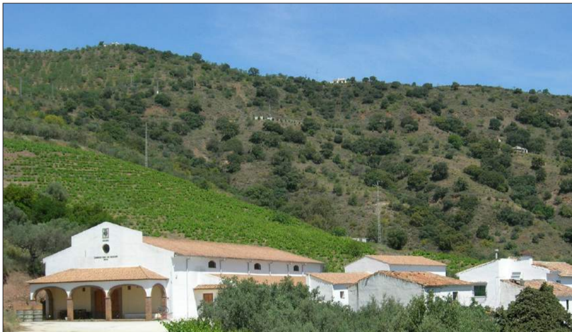
Vista de la Bodega, en Olías.