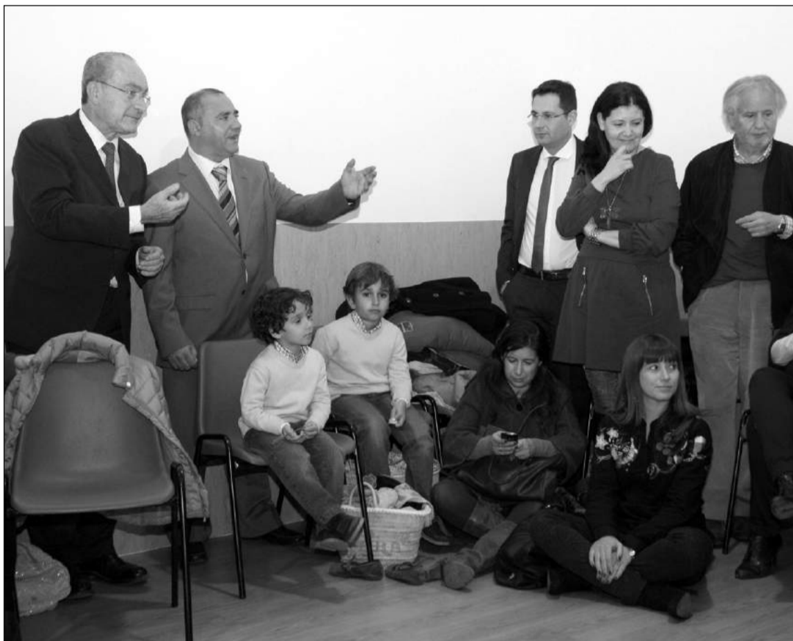
Un instante de la visita del alcalde de Málaga.