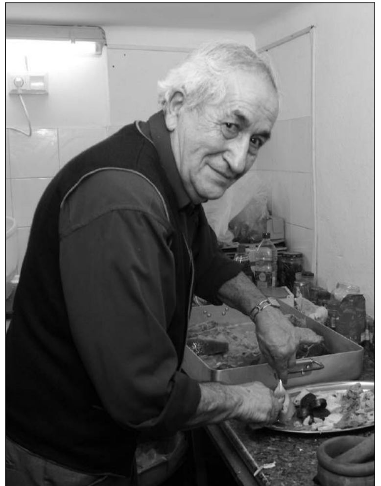
Preparativos de la pingá.

características, del buen ambiente flamenco. La Peña Flamenca Fosforito, entidad perteneciente a la Federación Malagueña de Peñas, Centros Culturales y Casas Regionales 'La Alcazaba', reune a buena parte de sus socios en su sede social para disfrutar de una comida de hermandad. De este modo, los asistentes disfrutaron de una buena 'primicia' en el caso de una peña de