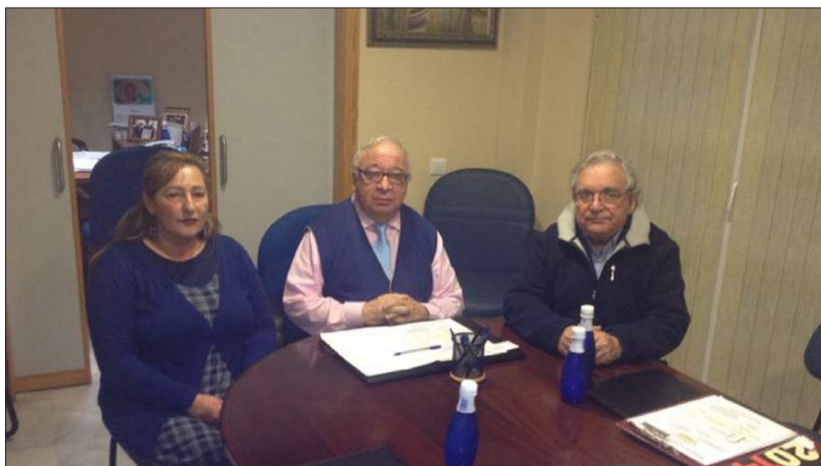
Un instante de la reunión en la sede de la Federación Malagueña de Peñas.