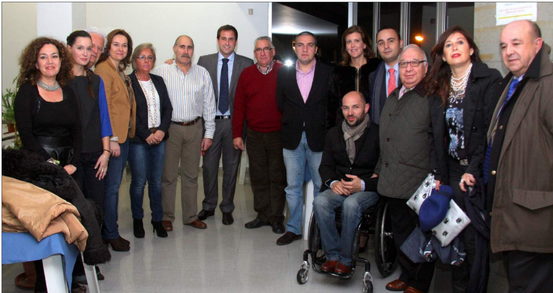
Autoridades, representantes de la Federación de Peñas, y miembros de la Asociación Cultural Amigos de la Copla.