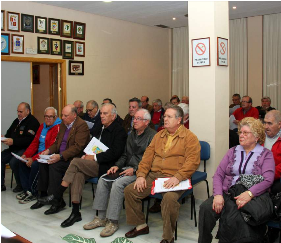
Presidentes y representantes de entidades federadas.