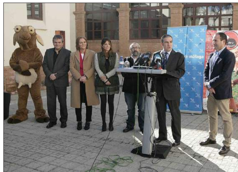
Presentación de la actividad en La Térmica.

En este sentido, recordó la gran capacidad de producción láctea de la cabra malagueña, que alcanza más de 70 millones de litros de leche al año, así como la producción anual de 2,5 millones de kilogramos de carne bajo la marca de garantía ‘Chivo Lechal Malagueño’.