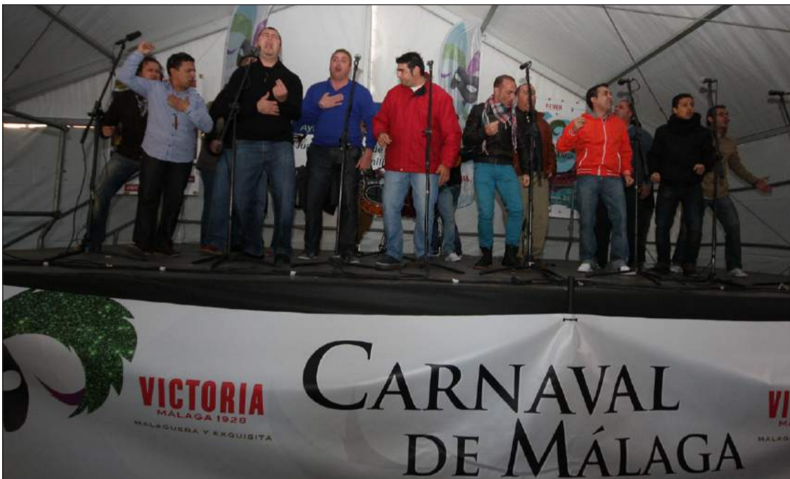
Un grupo actuando en la Berza Carnavalesca de 2013.