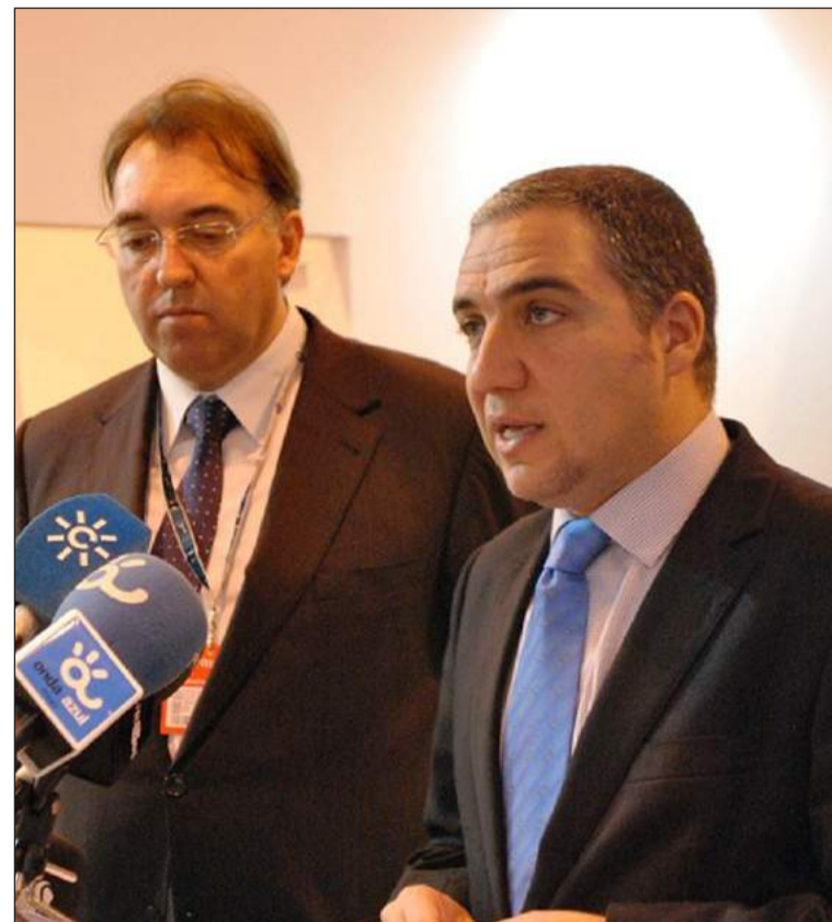
Un instante de la rueda de prensa de Elías Bendodo en Fitur.

En contra de la tendencia de decrecimiento en el resto del país, la provincia ha experimentado un repunte de la demanda interna en 2013, ya que el año pasado llegaron 3,7 millones de turistas nacionales: un 2,4 por ciento más que en 2012 (3,6 millones). Este incremento de 86.000 viajeros más se ve también reflejado en los dos millones de viajeros que se habrán alojado en hoteles (a falta de conocer el dato definitivo de diciembre), lo que supone un