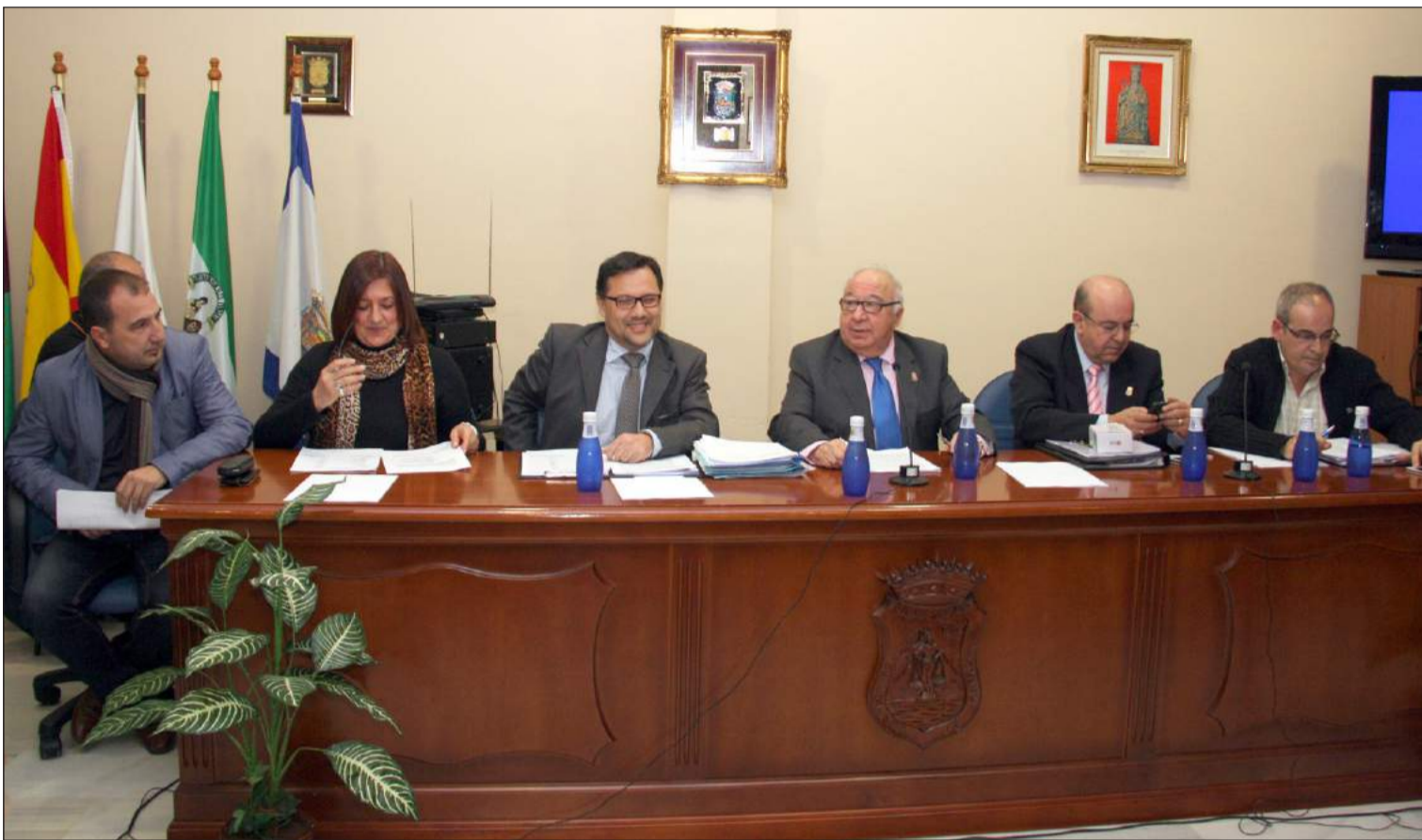
Imagen de la Asamblea General Ordinaria celebrada el pasado lunes en la sede de la Federación Malagueña de Peñas.

Número 542 29 de Enero de 2014 C/ Pedro Molina, 1 Tfno: 952 22 54 39 Fax: 952 21 48 82 E-mail: prensa@femape.com - la_alcazaba@hotmail.com Web: www.femape.com Edición digital: www.femape.com/laalcazabadigital Twitter: @FMPLaAlcazaba Búsquenos también en Facebook