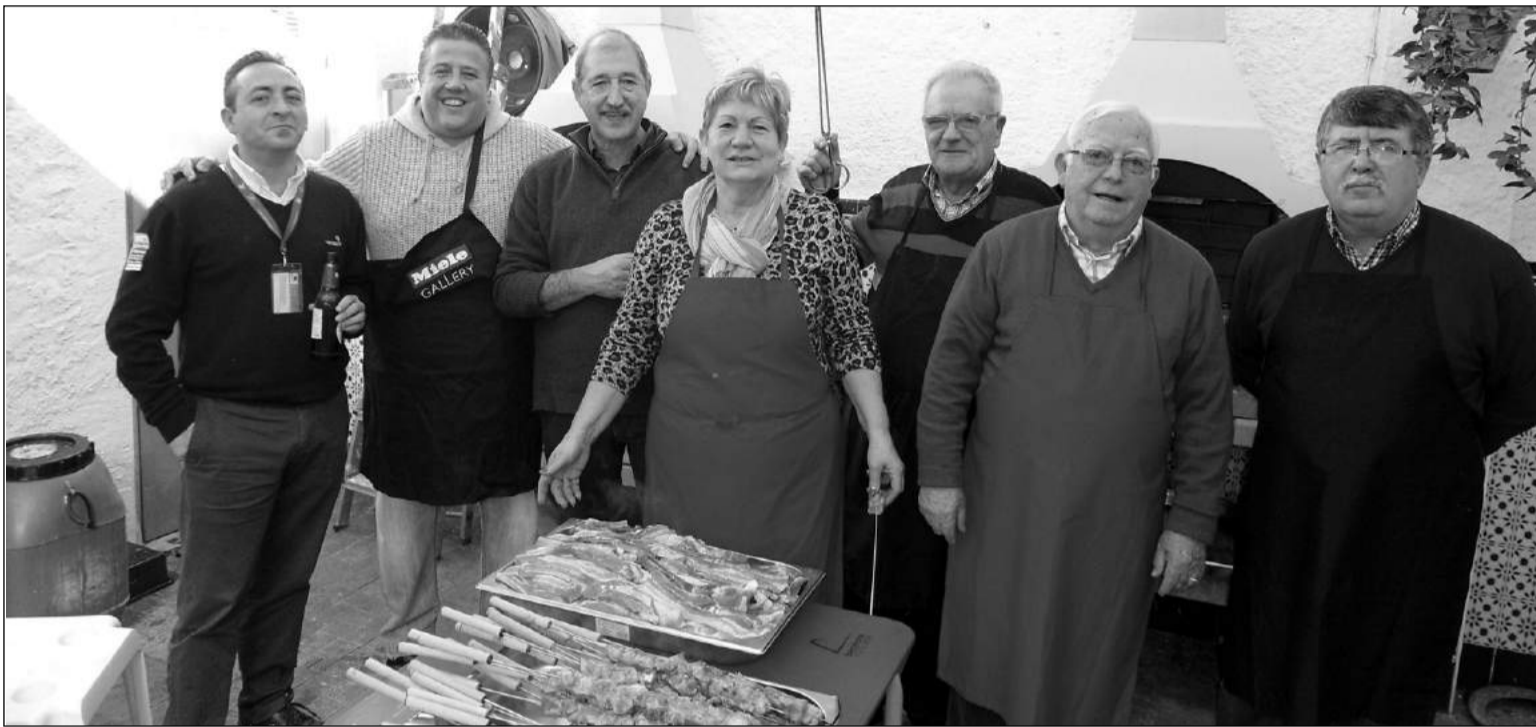
Un grupo de socios, con alguna de la carne que se pudo degustar.

Fue el pasado día 25 de enero, cuando en la sede de la entidad se dieron cita muchísimos socios y socias para dar buena cuenta de un innumerable número de kilos tanto de la estupenda carne de cerdo como de la exquisita de pollo, pudiéndose degustar todo lo que se quisiera hasta su terminación. También se incluyó la ensalada y el postre. El opíparo ágape pudo durar hasta bien entrada la tarde.