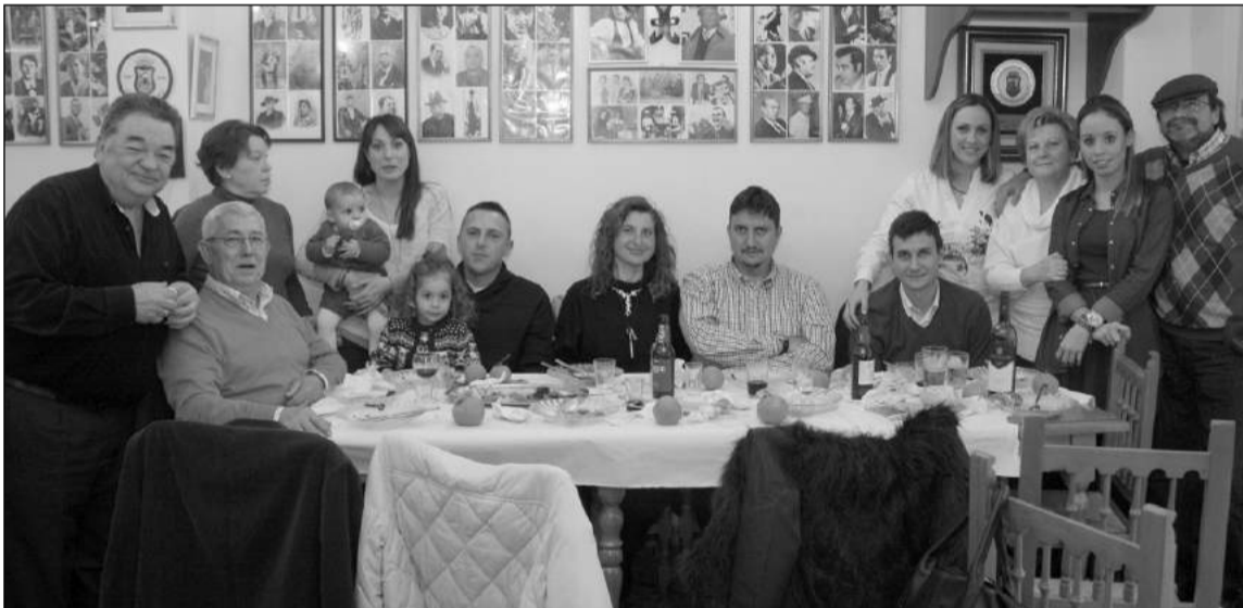
Un grupo de socios de la Peña Flamenca Fosforito.