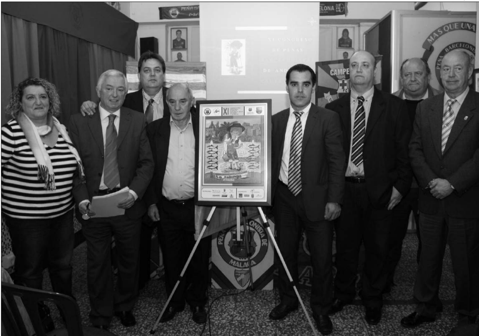
Presentación del cartel del congreso.

La jornada central del congreso será el sábado 31 de mayo, con una concentración de peñas con banderas y estandartes, un pregón o una fiesta popular al mediodía con la colaboración de la Federación Malagueña de Peñas, y expositores diversos de productos de Sabor a Málaga, entre otros. Esa tarde tendrán lugar las jornadas de trabajo y se cerrará con una cena de gala para más de mil personas en Churriana.