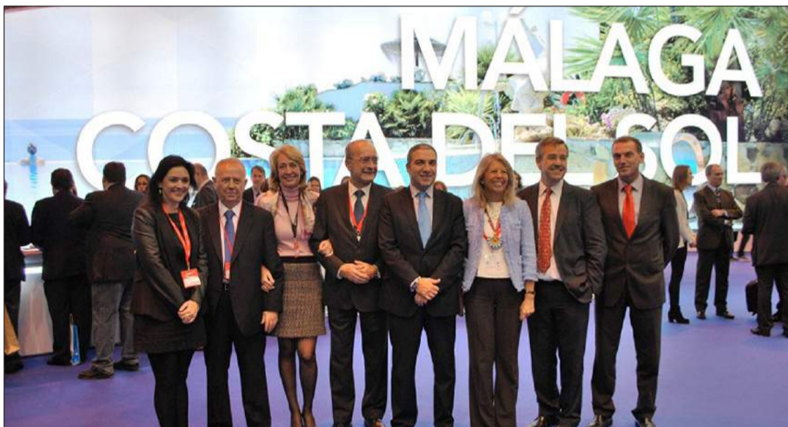
El presidente de la Diputación y el alcalde de Málaga, entre otras autoridades de la provincia.