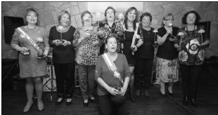
Distinciones a señoras de la entidad.

Se hicieron entrega de diversas distinciones a lo largo del acto.