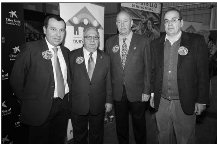
El Delegado del Gobierno, con la representación de la Federación de Peñas.