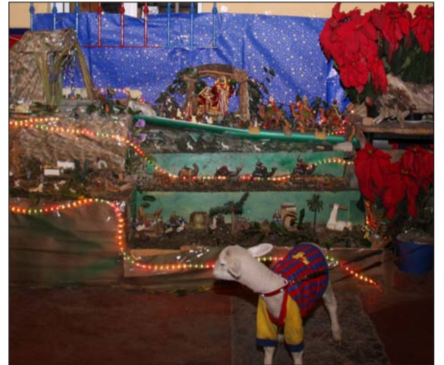
Peña Barcelonista El Palo.