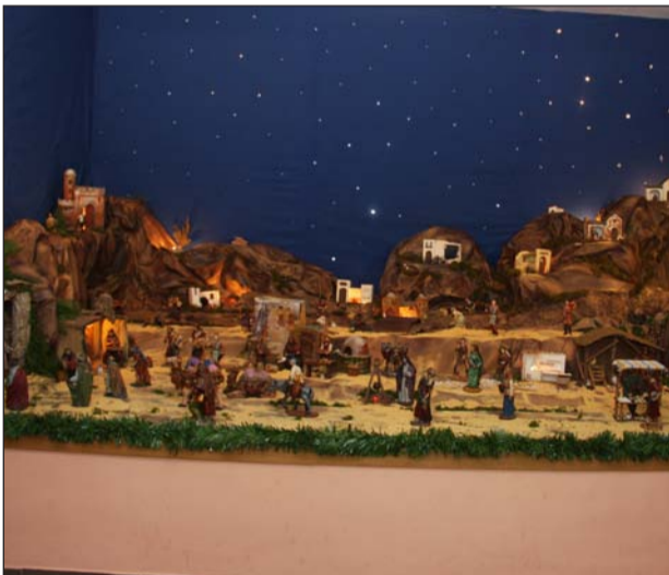
Peña La Biznaga.