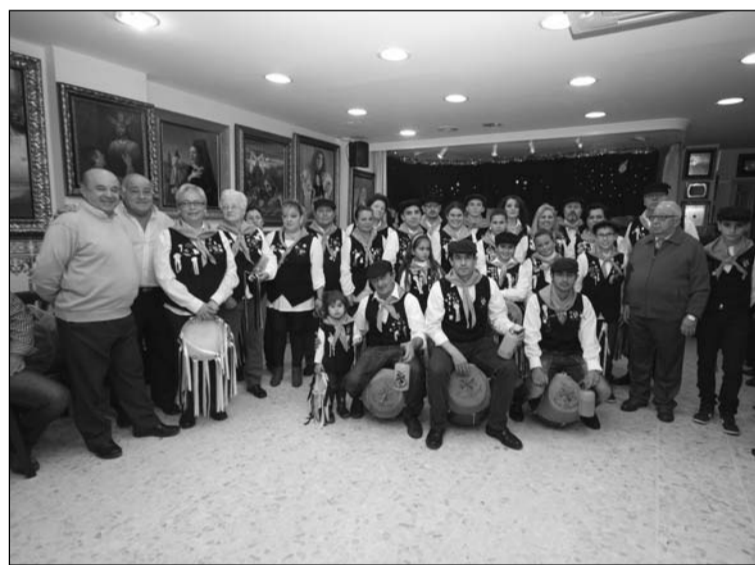
Inauguración del Belén.

El almuerzo de Navidad está anunciado para el sábado 21 de diciembre, con la entrega de un Escudo de Oro a uno de sus socios; mientras que el día 24, ya en Nochebuena, están citados los socios a mediodía. En Nochevieja, la sede también estará a disposición de los socios que quieran celebrar allí el fin de año.