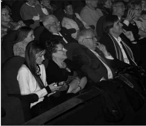
Diversos concejales asistieron al espectáculo.