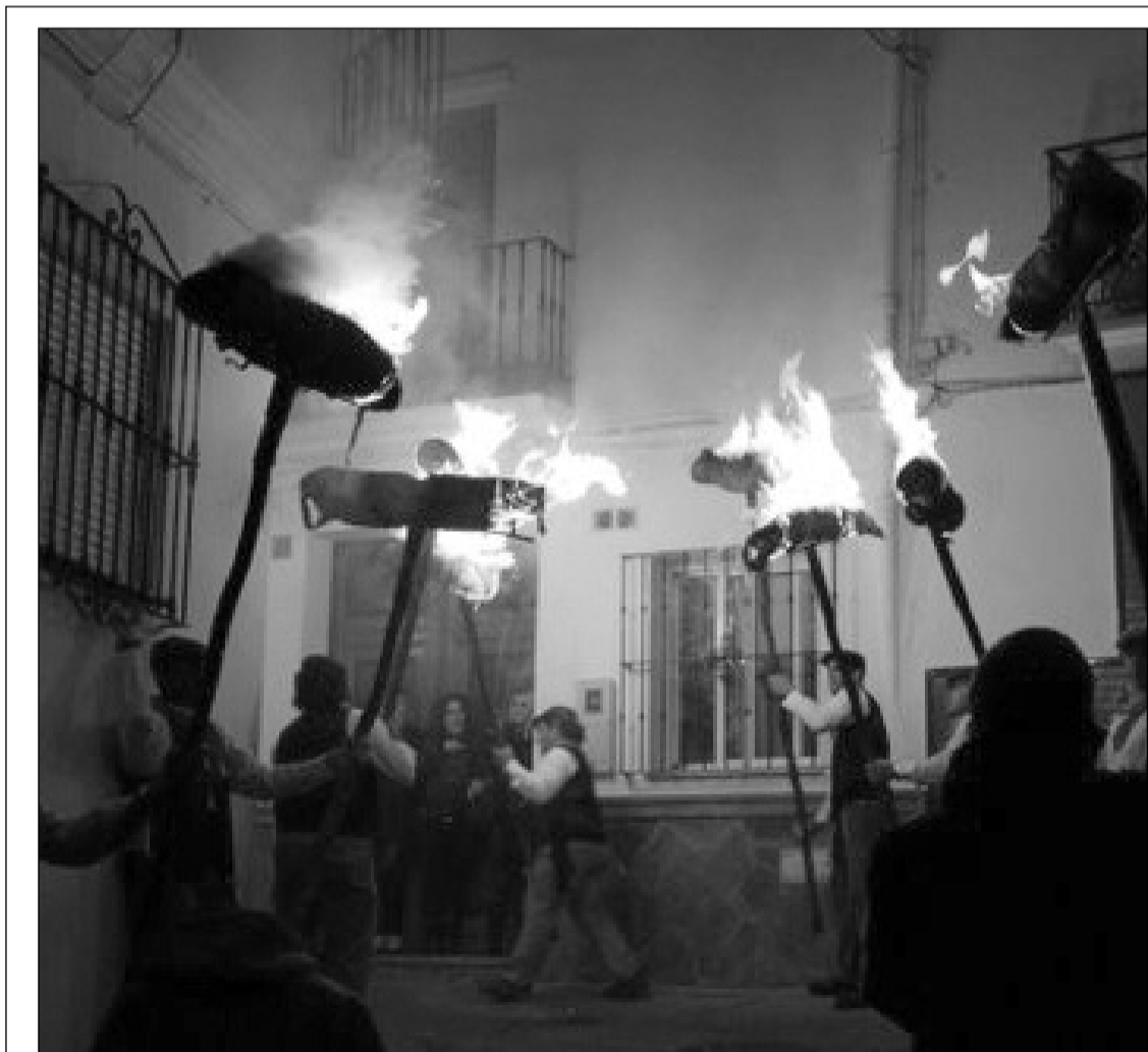
El pasado 12 de diciembre tenía lugar en la localidad de Casarabonela la procesión de la Virgen de los Rondeles, una fiesta declarada de Interés Turístico Nacional de Andalucía en el año 2001, y Fiesta de Singularidad Turística Provincial en el año 2006 por la Diputación de Málaga. Se trata de una noche donde el fuego y los villancicos adquieren un protagonismo especial, iluminando y escuchando en el recorrido de una procesión que hunde sus raíces en las brumas del tiempo.