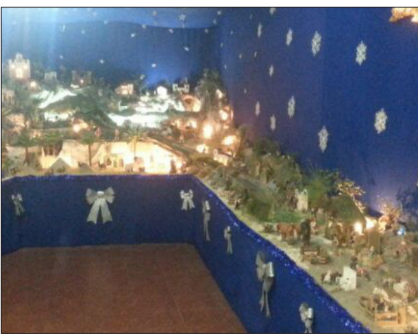
Casa de Álora Gibralfaro.