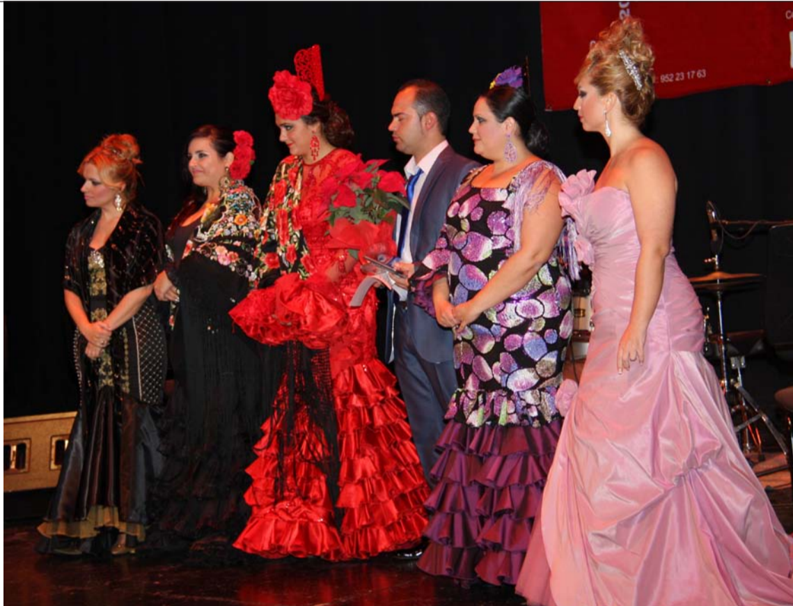
Finalistas de esta edición.