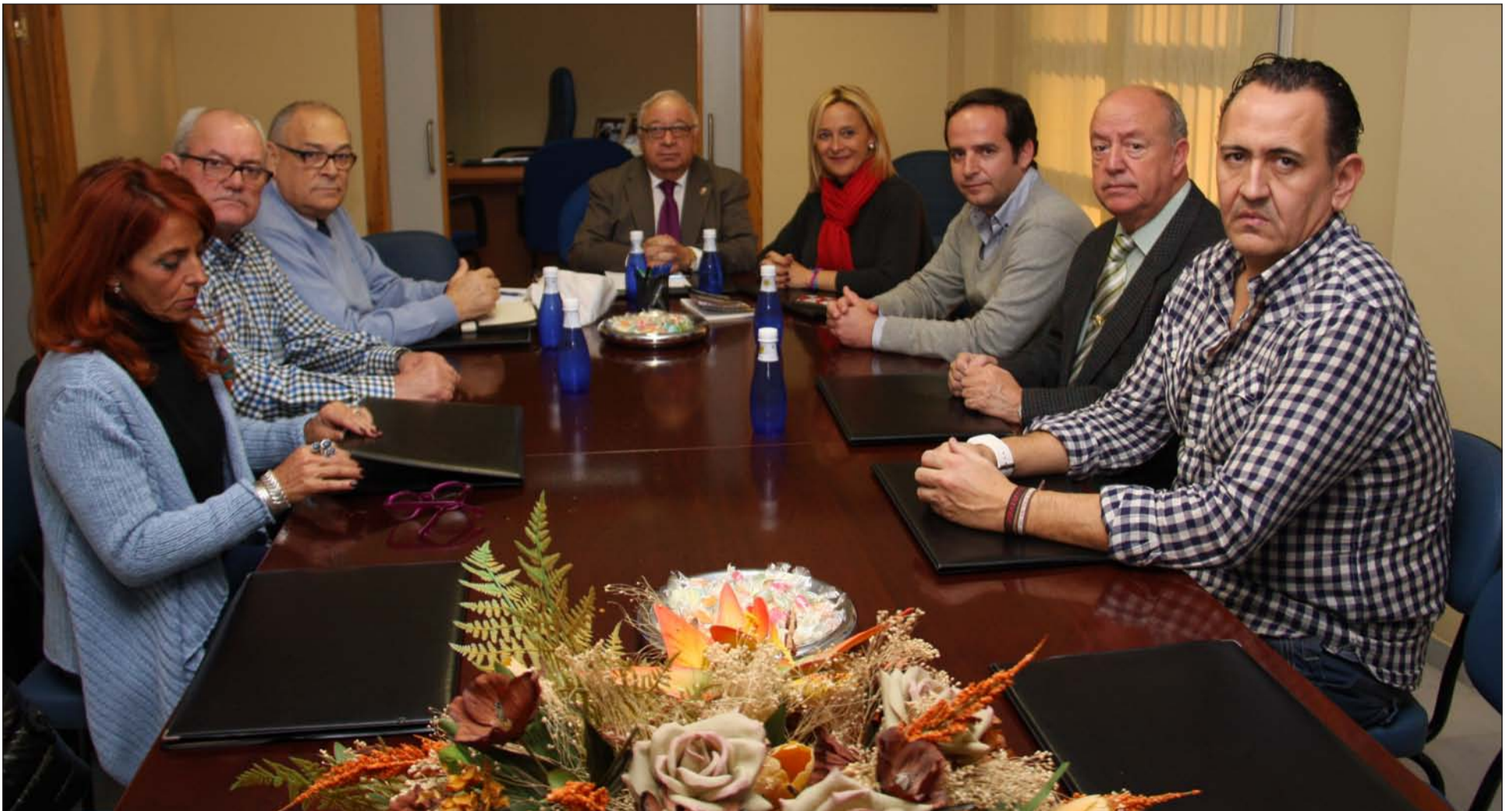
Reunión con directivos de la Federación.