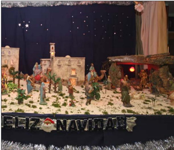
Peña Recreativa Trinitaria.