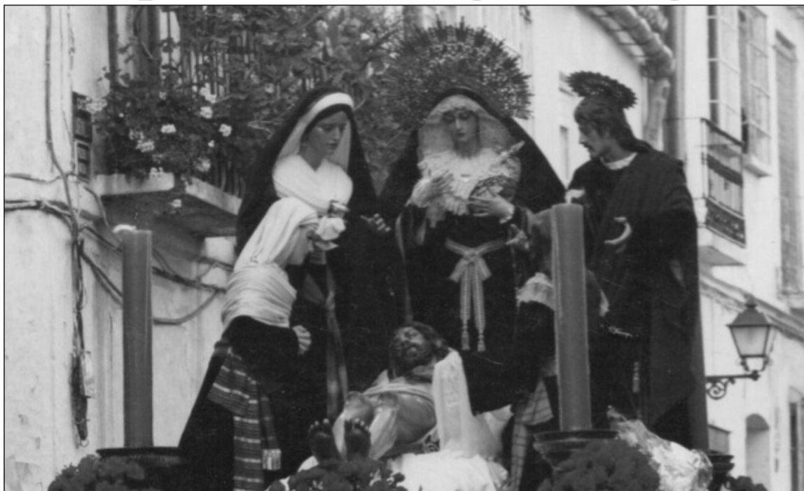
Aspecto que presentaba el grupo escultórico en sus primeras salidas procesionales.