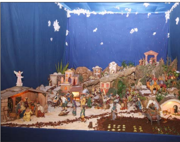
Peña El Seis Doble.