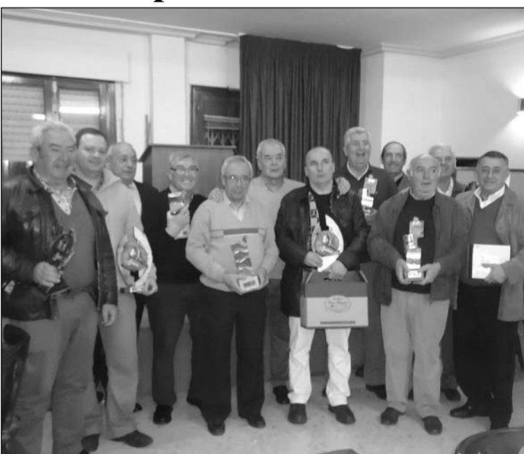
Ganadores del Campeonato, durante el acto de entrega de trofeos.