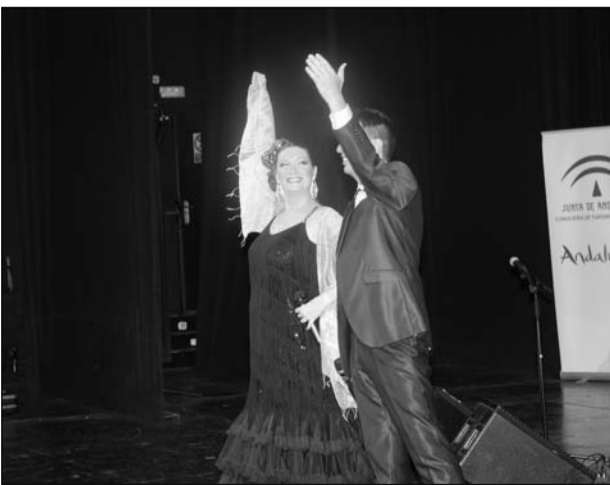
El dúo fue uno de los momentos estelares de la gala.