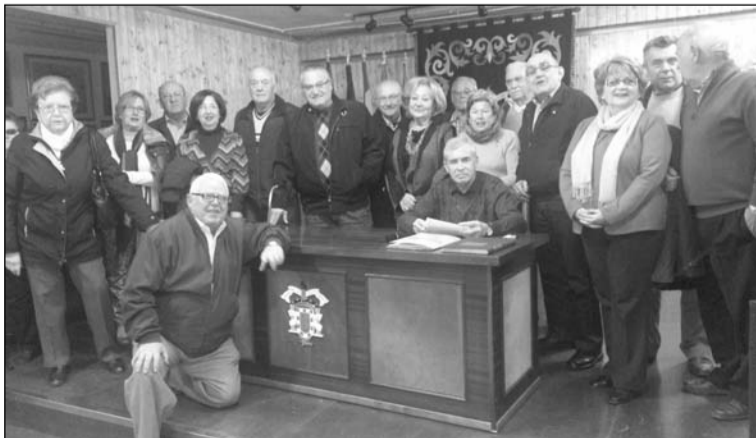
Un grupo de socios tras la asamblea.