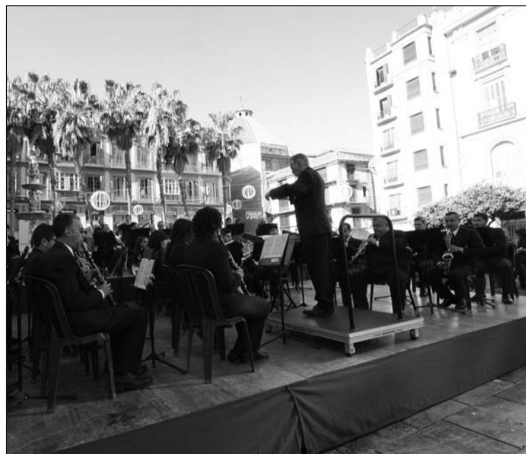
La banda municipal ofreció un concierto.