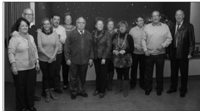
Imagen de la inauguración del Belén.

Ya en Nochevieja, desde las 23 horas dará comienzo esta fiesta tan entrañable para socios y amigos simpatizantes de La Biznaga.