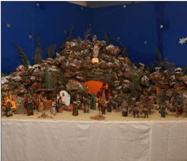
Peña El Parral.