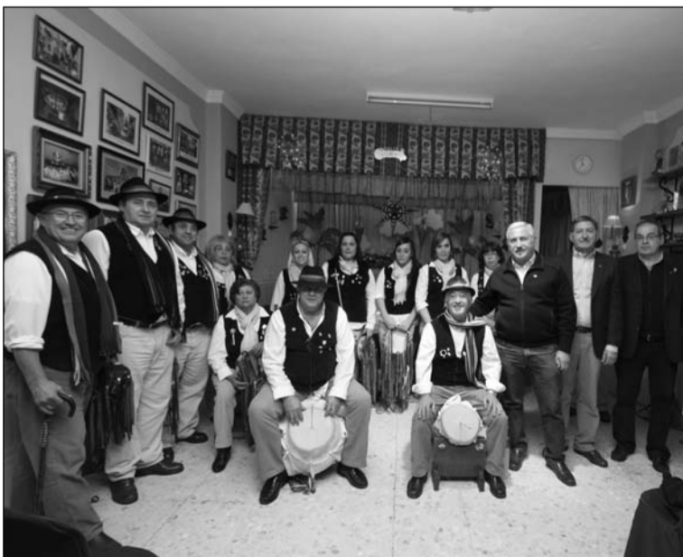
Acto celebrado en Churriana.