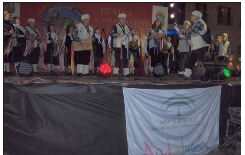
Actuación en el escenario de la plaza de la Constitución