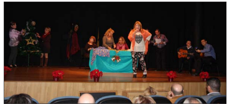
Un instante de la representación.