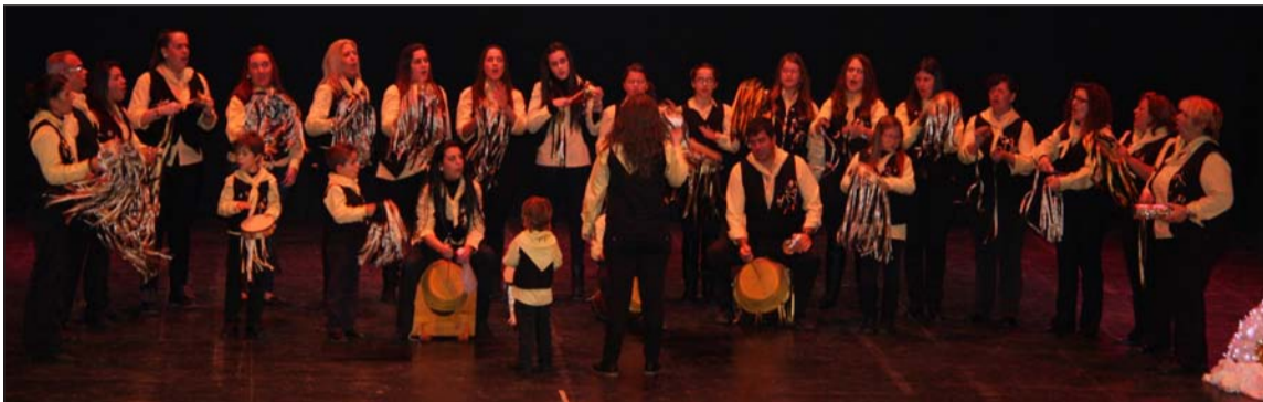
Una de las pastorales, el pasado año, en las tablas del Cervantes.