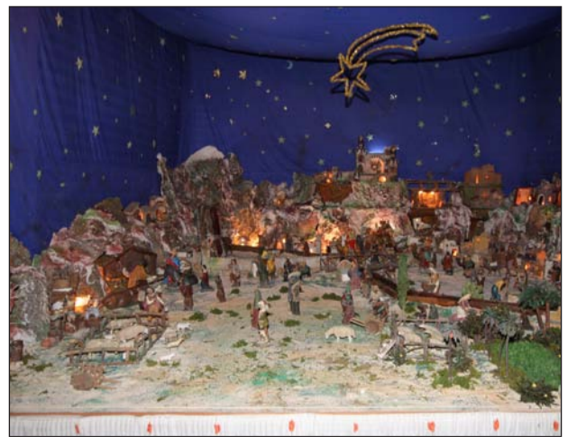
Peña Los Ángeles.