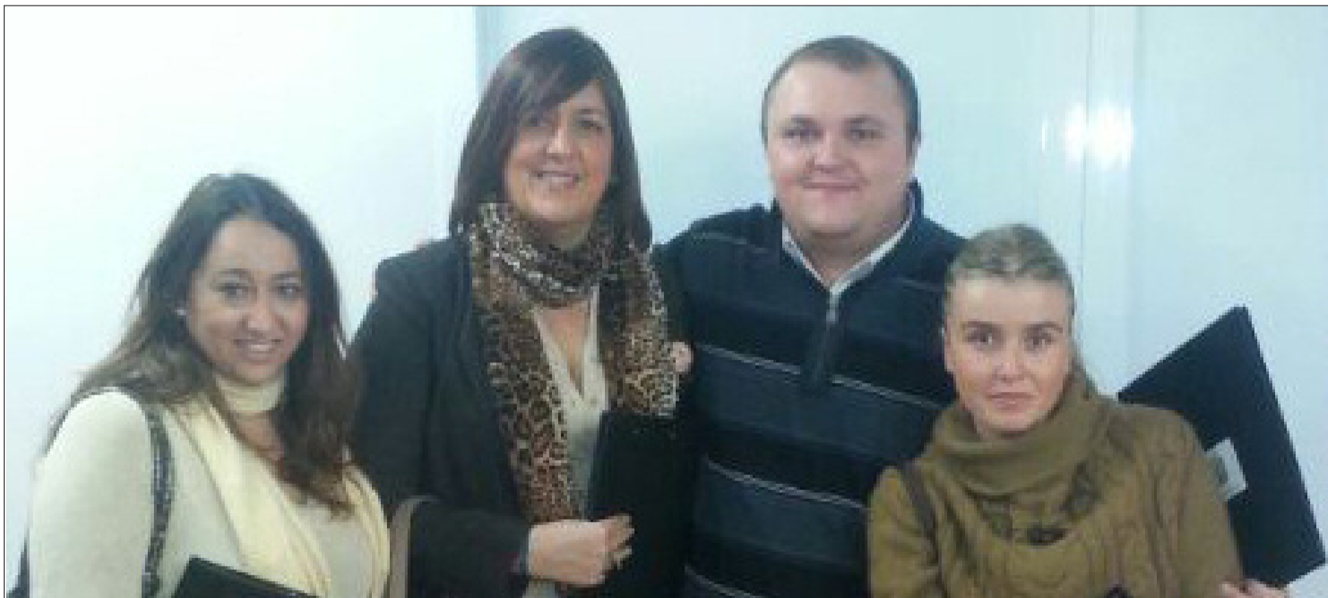
Componentes del jurado, durante sus visitas.

El Jurado está compuesto por personas imparciales, cualificadas en arte, cultura, decoración, diseño, etc. Es designado por la Federación y no puede pertenecer a ninguna entidad federada.