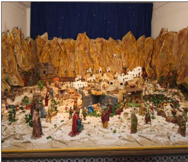
Peña El Boquerón.