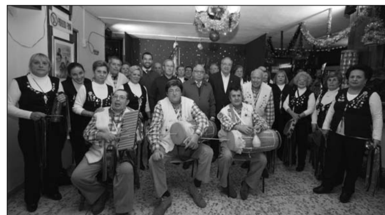
Inauguración del belén.

De cara a Nochevieja, la entidad ha organizado una excursión a un hotel de Nerja, donde disfrutar de la entrada del año 2014. La sede estará cerrada los días 23, 24, 25, 30 y 31 de diciembre, y el 1 de enero.