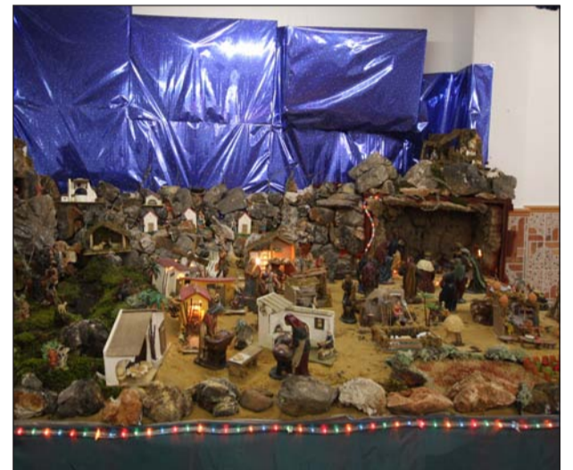
Peña La Virreina.