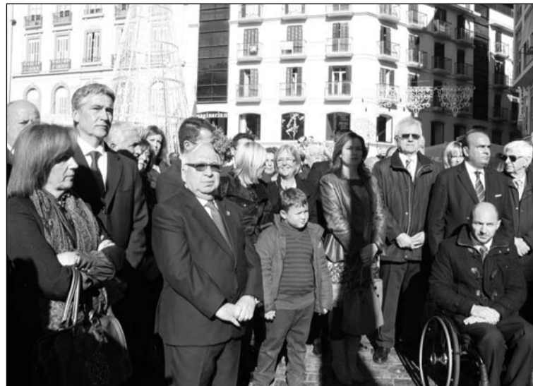
El presidente de la Federación de Peñas acudió a este acto.