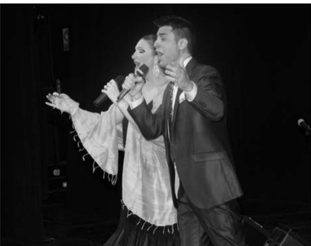
Alba y Palomo, en el escenario.