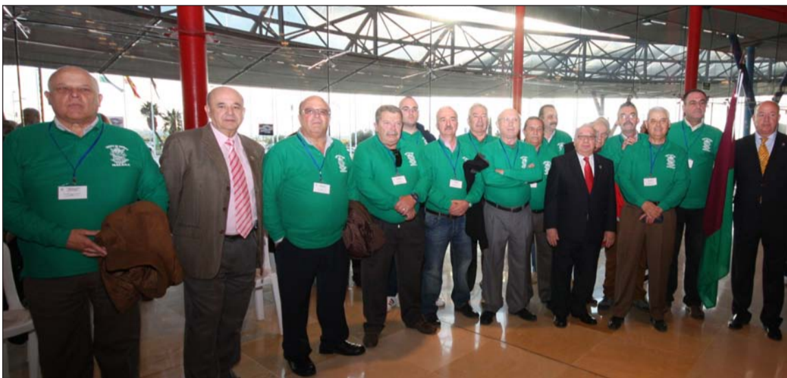
La Peña La Rosaleda representó a Málaga en esta competición.