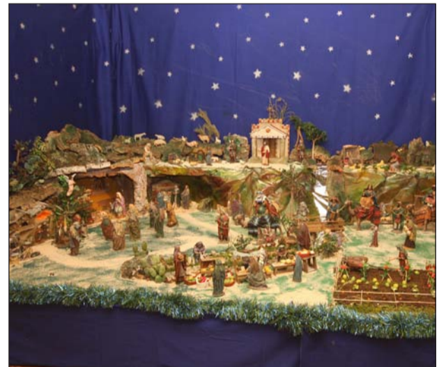
Peña Los Rosales