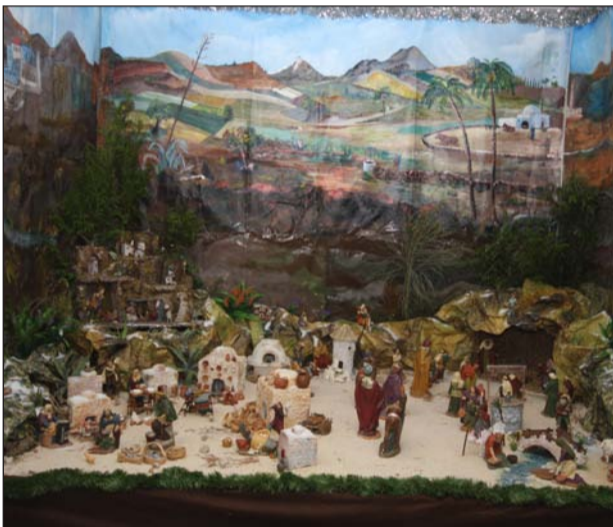
Peña Nueva Málaga.