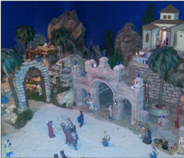
Peña Colonia Santa Inés.