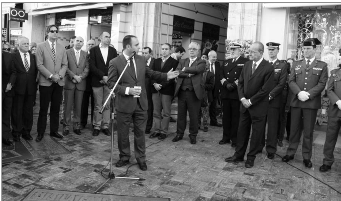
Autoridades civiles presentes.