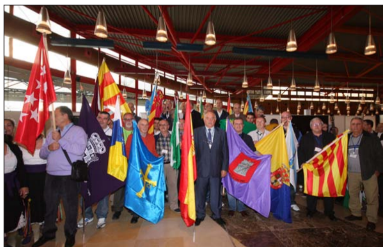
Representación de todas las delegaciones participantes.