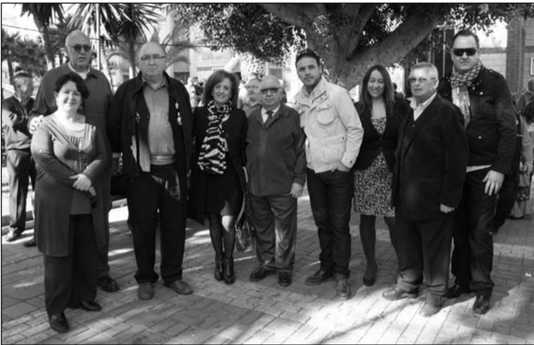
Autoridades y peñistas asistentes al acto.