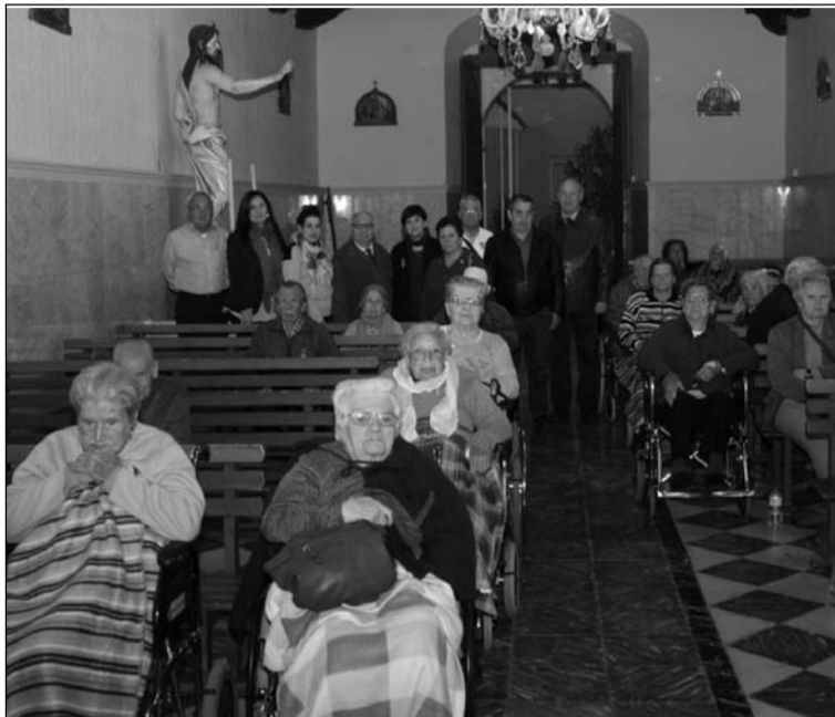
Algunos de los participantes, en la iglesia de la residencia.