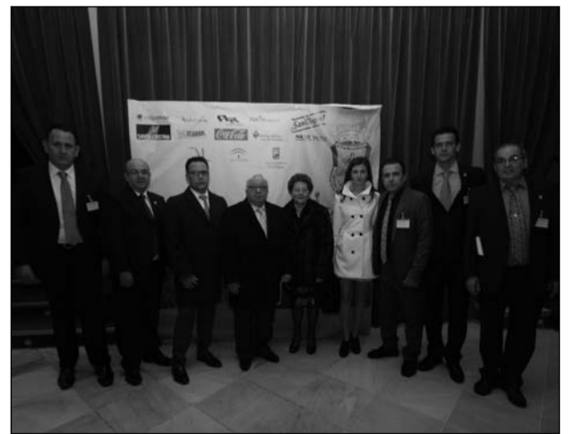
Algunos de los directivos de la Federación de Peñas.