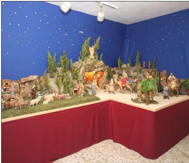
Peña El Sombrero