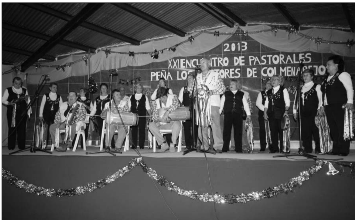
Actuación de unas de las pastorales participantes.