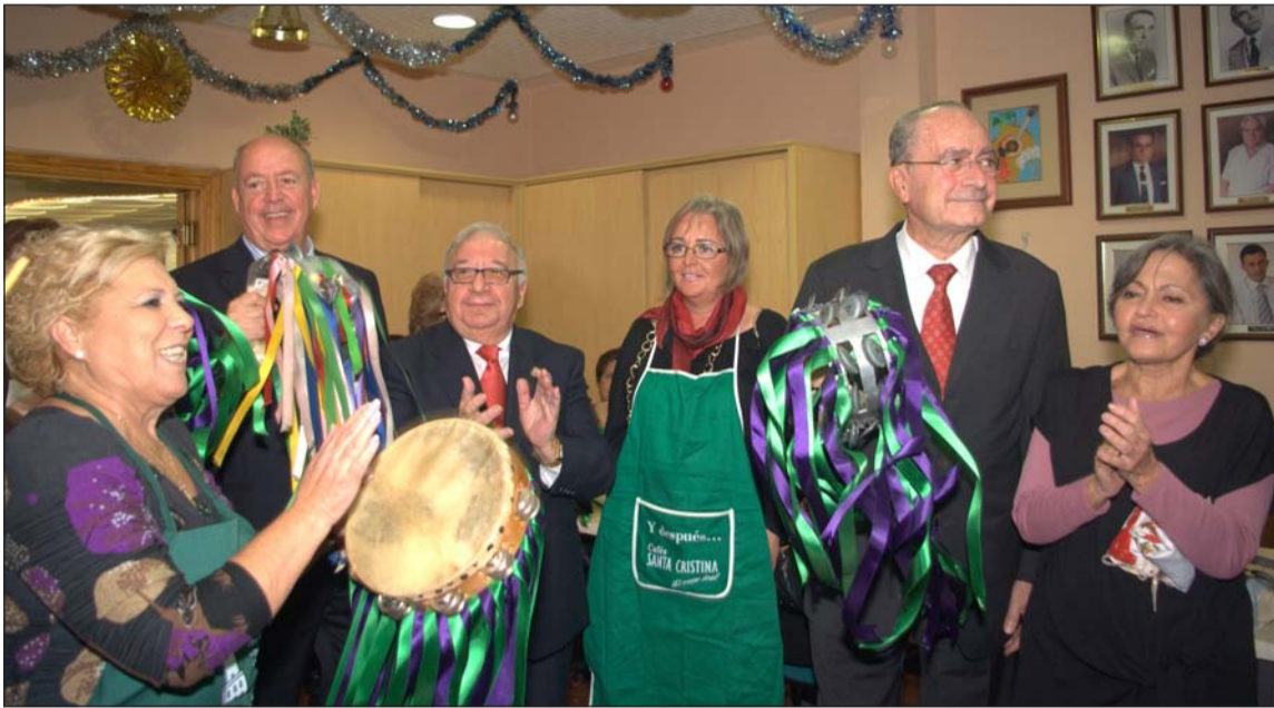
Tras realizar los borrachuelos, no faltaron los villancicos.