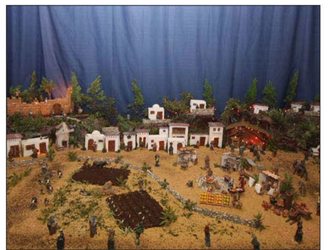
Peña Cortijo de Torre.