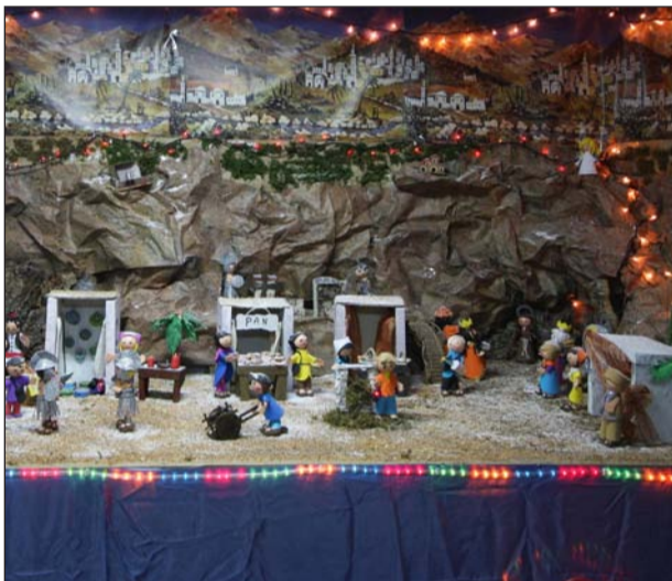
Peña Santa Marta.