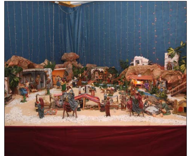
Casa de Melilla en Málaga.