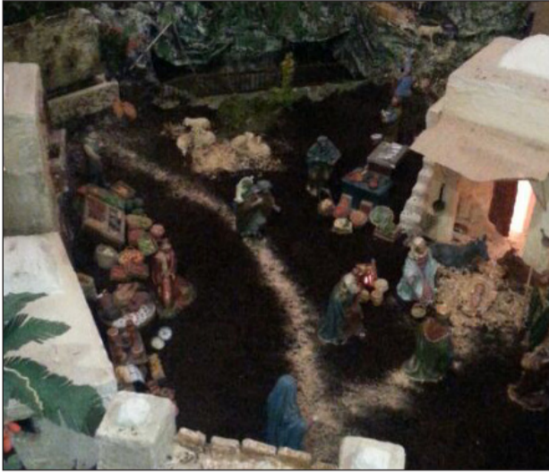
Peña Santa Cristina.