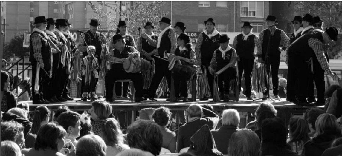
Una de las pastorales, durante el encuentro.