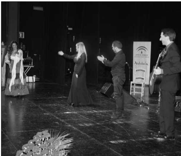
Fin de la actuación flamenco.