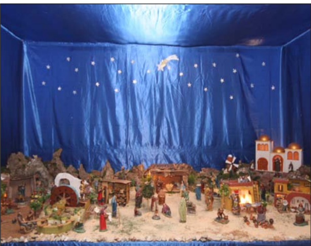
Agrupación Cultural Telefónica.