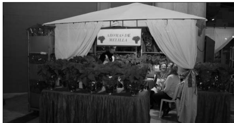
Puesto instalado un año más por la Casa de Melilla en Málaga.