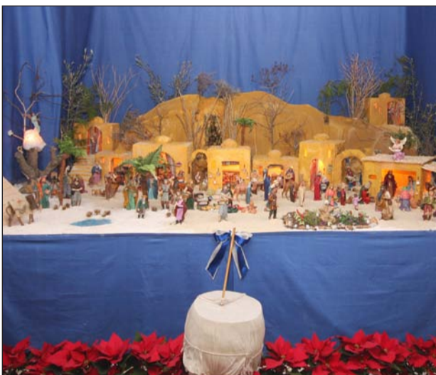
Peña Costa del Sol.