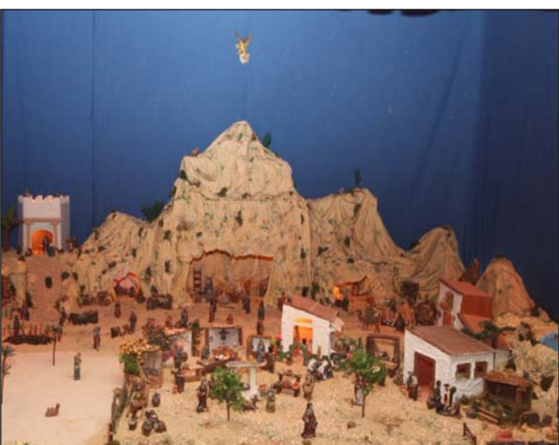
Peña Er Salero.