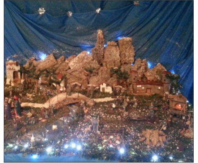
Peña San Vicente.