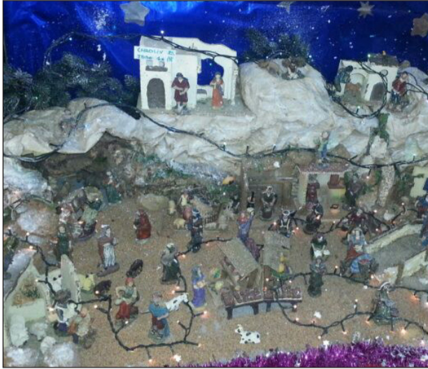
Peña Recreativa Palestina.