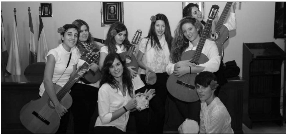
Ensayo de la tuna en la sede de la Federación.

De este modo, además, se facilita la participación de la juventud dentro de las peñas malagueñas.