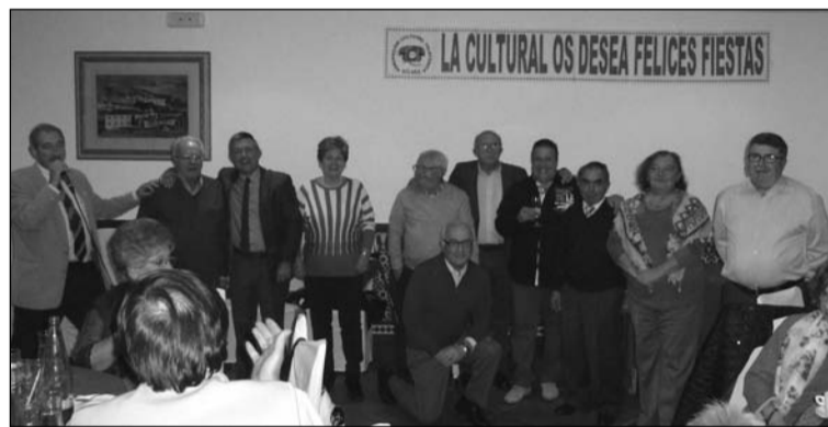
Celebración navideña en un hotel.

Sin tregua casi, al día siguiente, domingo 16, tras el almuerzo en la propia sede de la entidad, hubo una sobremesa especial ya que se recibió la visita de la Pastoral de la Colina Santa Inés, que como cada año levantó la admiración de los muchísimos asistentes a la jornada.