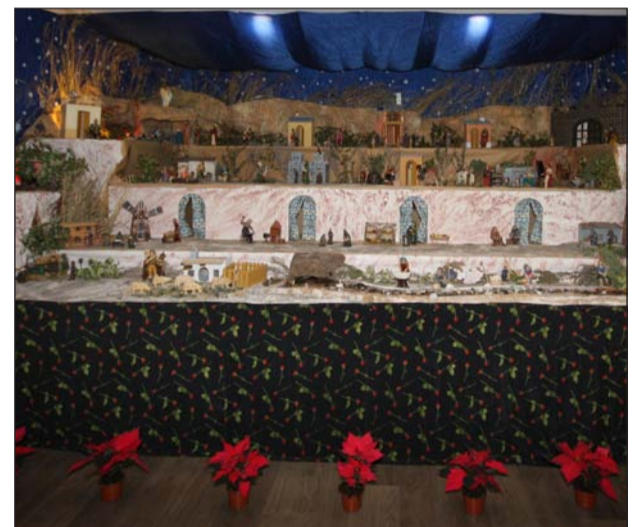
AA. VV. Zona Europa.