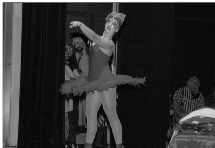
Un instante de la representación.