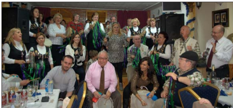
Villancicos tras la comida de Navidad.