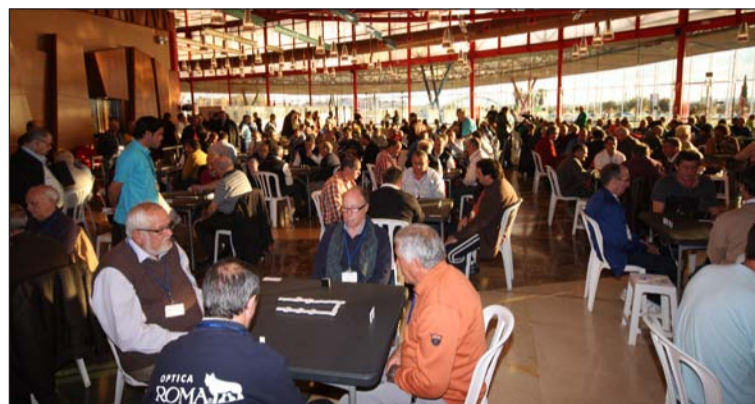
Aspecto del Palacio de Congresos durante la disputa del campeonato.