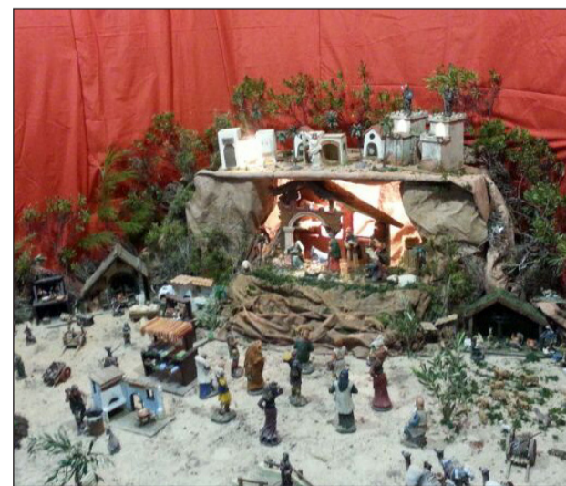
Peña La Asunción.