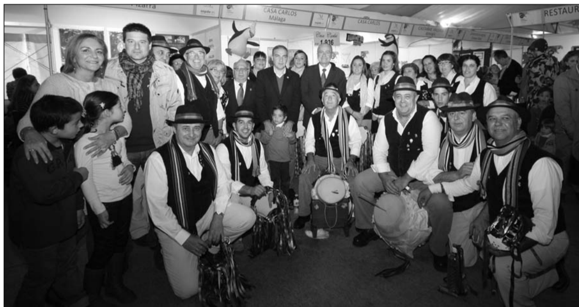
La Pastoral del Centro Cultural Renfe, una de las participantes en Sabor a Málaga.