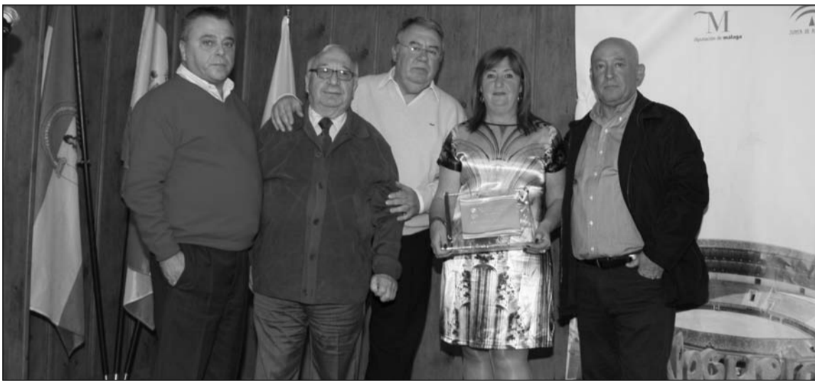
Entrega de un recuerdo por parte de la Federación de Peñas a la presidenta de la entidad.