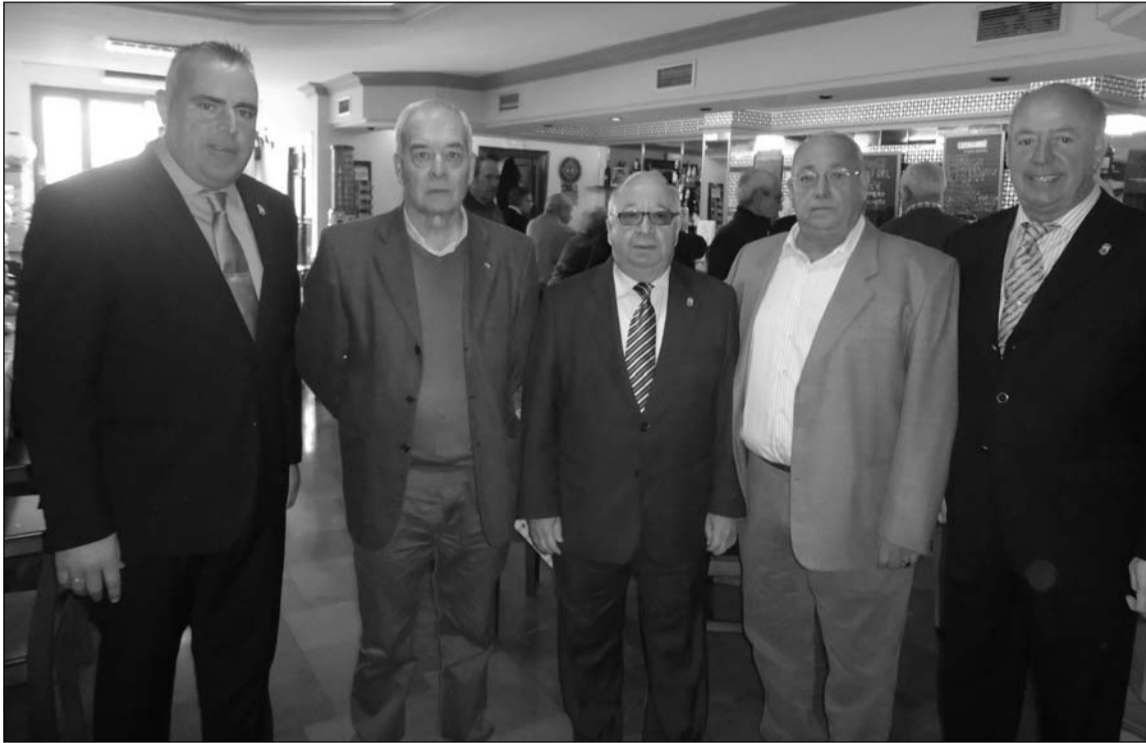
Representantes de la Federación de Peñas y de la Sociedad Excursionista Antequerana.