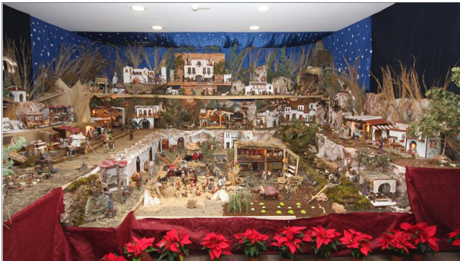
Belén ganador del pasado año.

El Jurado estará compuesto por personas imparciales, cualificadas en arte, cultura, decoración, diseño, etc. Será designado por la Federación y no podrá pertenecer a ninguna entidad federada.