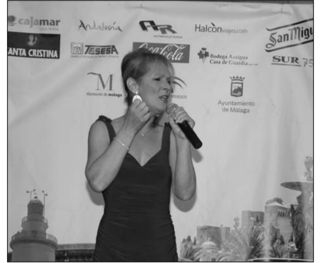
Una de las participantes en la gala de clausura.