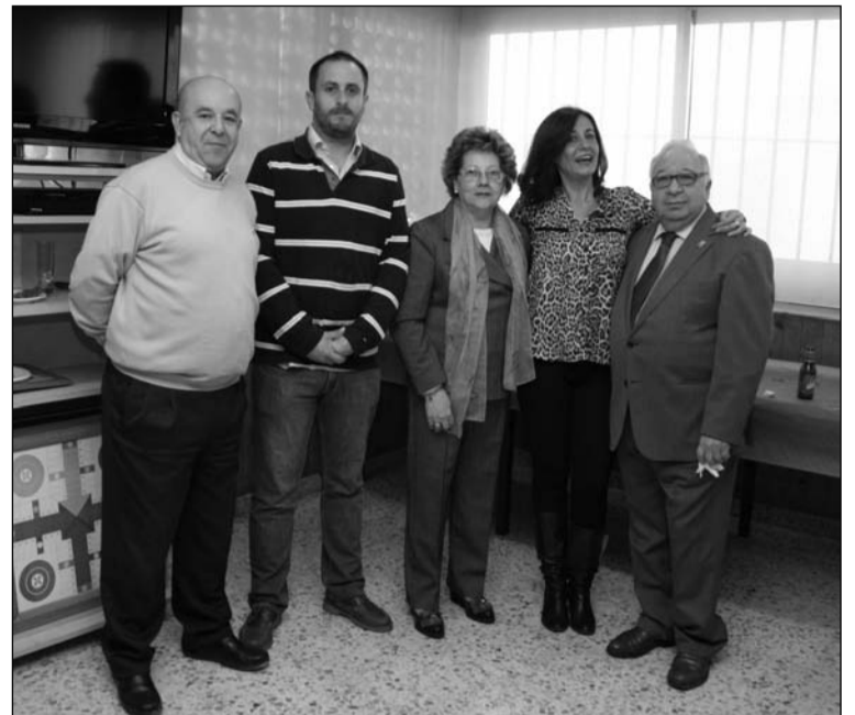
Junta a representación peñista también estuvo presente el Distrito.

Las actividades del mes y el año se cierran el 31 de diciembre con una cena de Nochevieja.