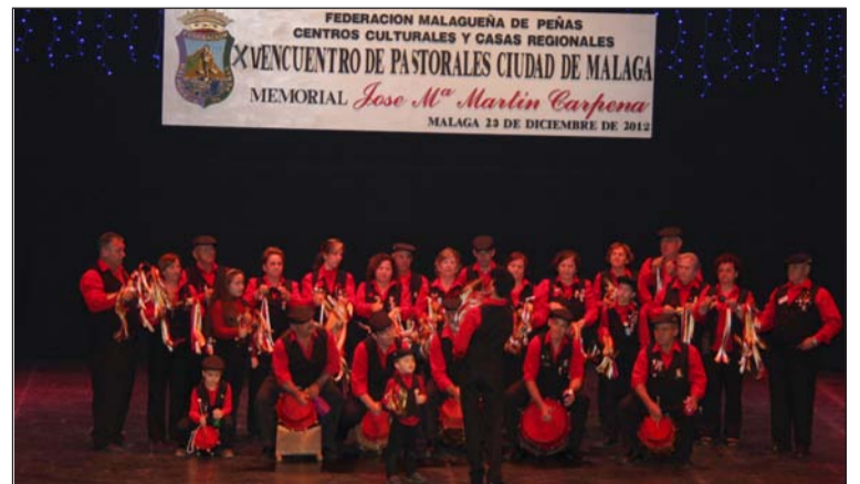
Imagen de archivo de la edición de 2012.