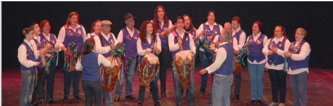
Una de las pastorales, el pasado año, en las tablas del Cervantes.