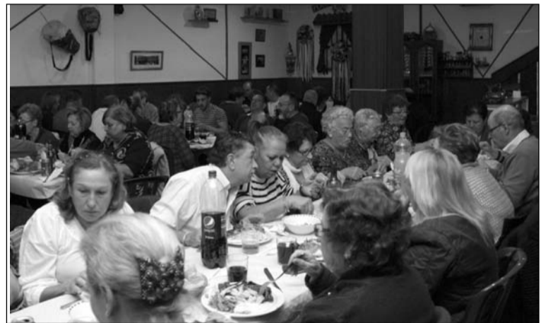
Imagen del salón durante la comida.

Finalmente, las actividades de este mes de diciembre y del presente año 2013 se cerrará el día 31 con baile y diversión en una gran fiesta que se celebrará a partir de la medianoche, tras las doce campanadas.