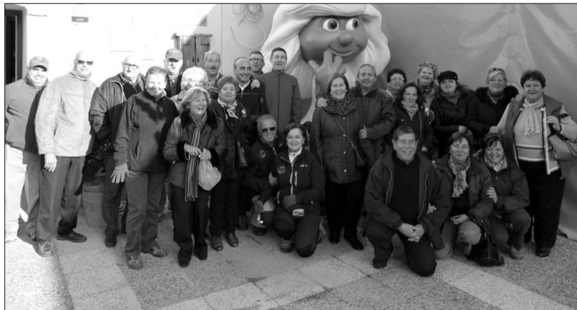
Los peñistas, junto a Pitufina en Júzcar.