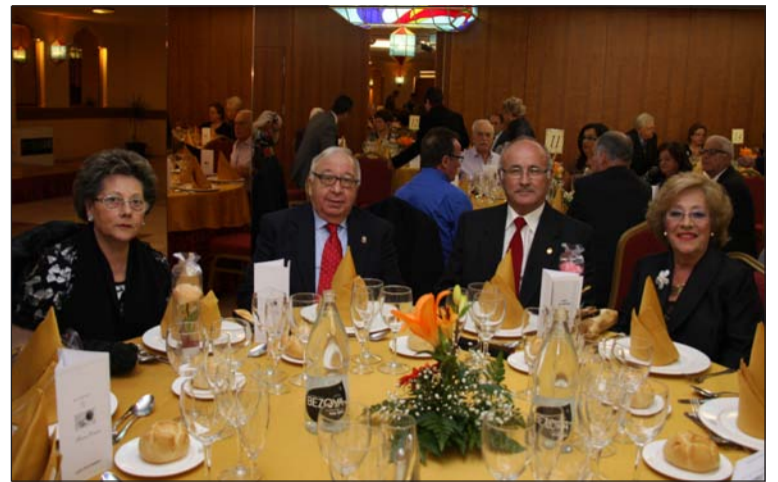
Los presidentes de la Federación y la Peña Los Ángeles, con sus esposas.

Con tal motivo, los socios se desplazaron hasta la localidad costasoleña de Nerja, en uno de