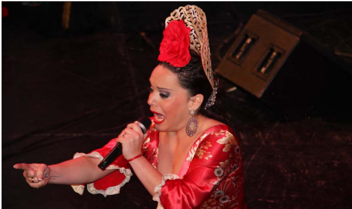
La ganadora del Certamen, en un instante de su actuación.