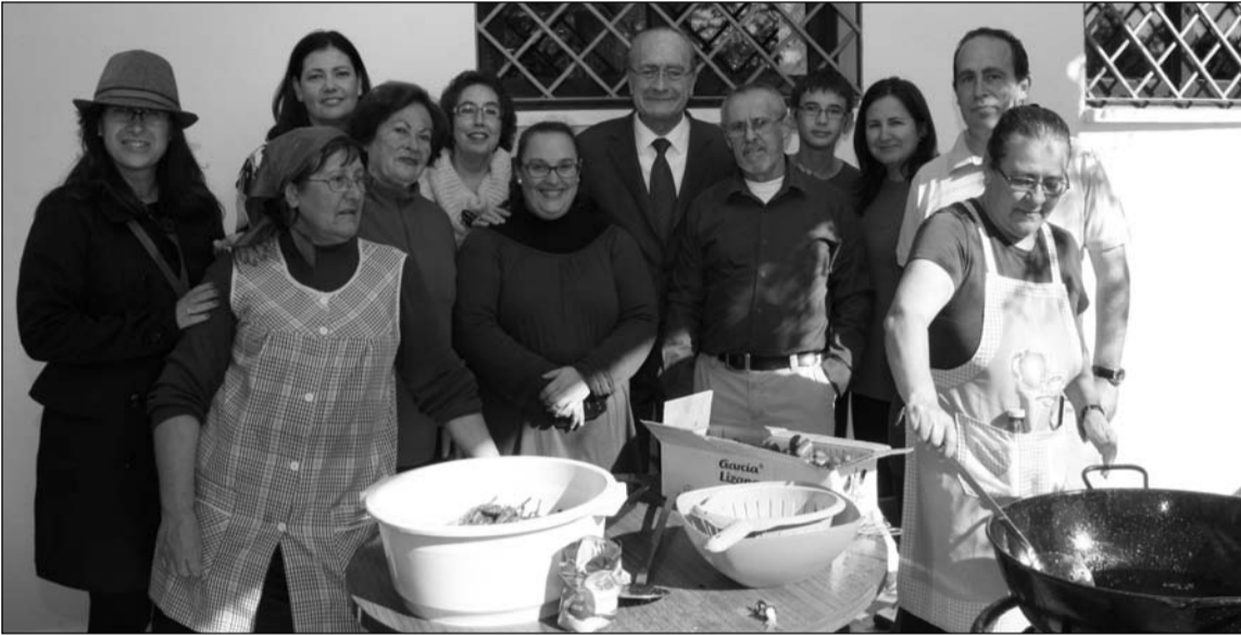
El alcalde estuvo presente durante los preparativos de las migas.