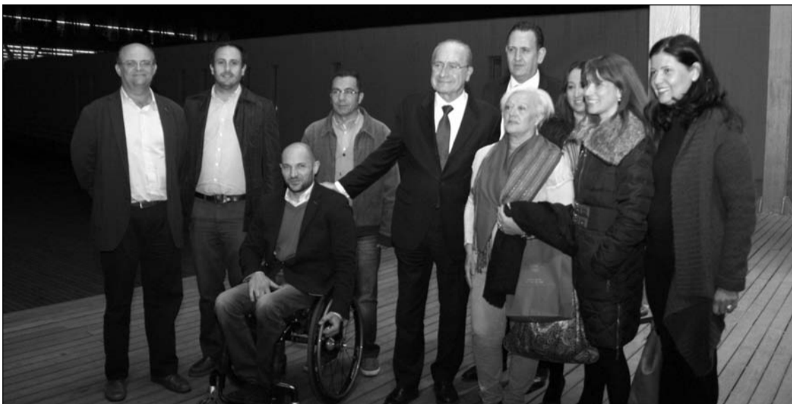
Organizadores, autoridades y representantes de la Federación de Peñas, en la entrada al recinto.

Igualmente se creó una filacero, para la que se pueden realizar aportaciones económicas en la cuenta 0182 5918 40 0201504012.