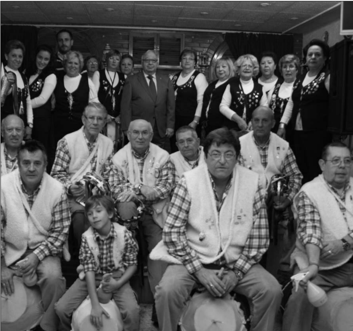
El presidente Miguel Carmona, con los componentes de la pastoral.