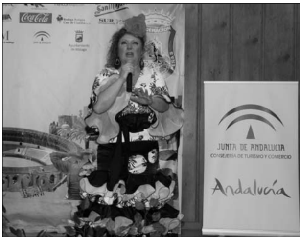
Una de las últimas participantes.