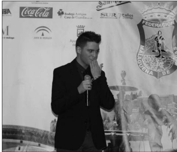
Los hombres también participan en la escuela de Copla.