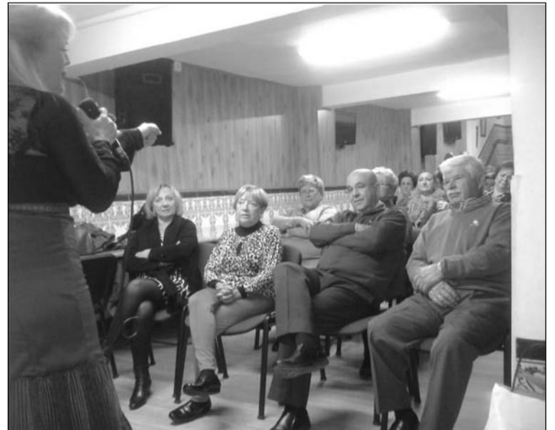
Un instante de la actuación.

tra Señora de la Esperanza' de Churriana, para hacerles llegar a los mayores unos regalitos de parte de esta entidad perteneciente a la Federación Malagueña de Peñas, Centros Culturales y Casas Regionales 'La Alcazaba'.