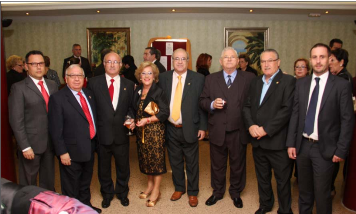
Representación de la Federación de Peñas, la Peña Los Ángeles y otras entidades federadas.