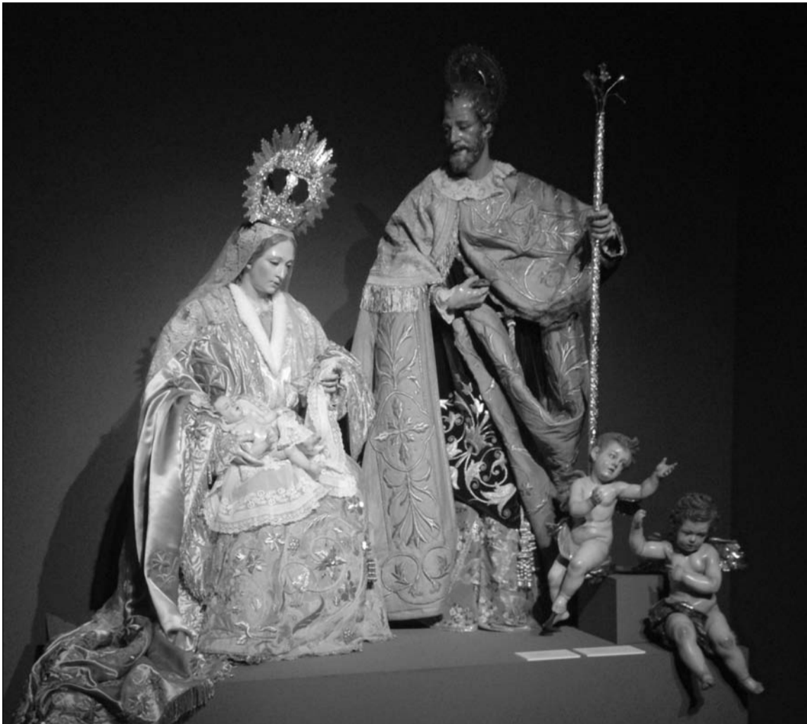
Imagen de la exposición recién inaugurada.