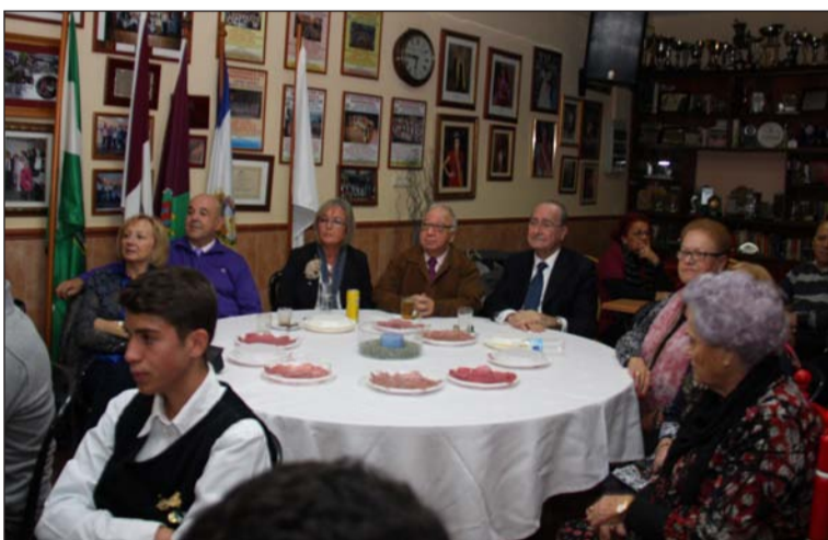
Numerosos socios y simpatizantes se dieron cita en la sede.