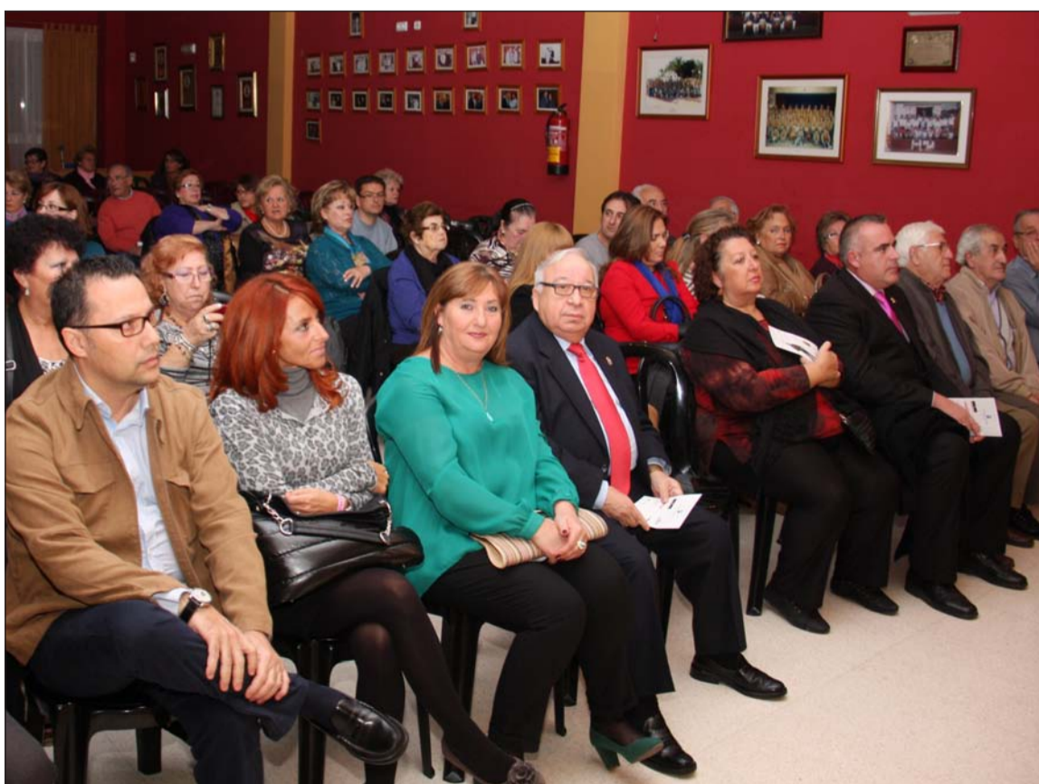
Aspecto que presentaba el salón de actos de la Peña Santa Cristina.