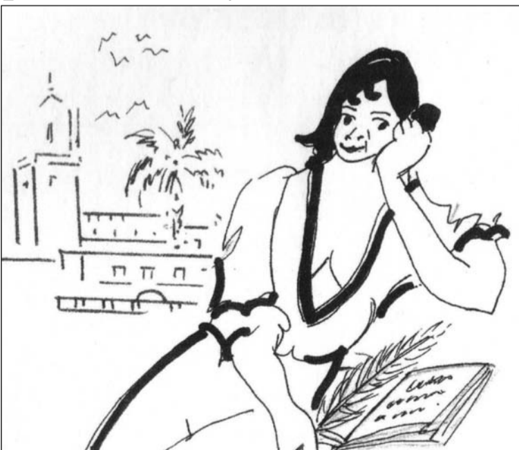
Ilustración del libro que hoy se presenta.