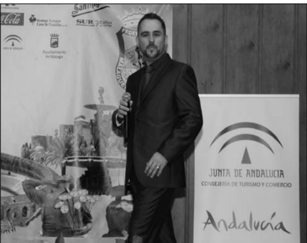
Una de las actuaciones de este espectáculo.