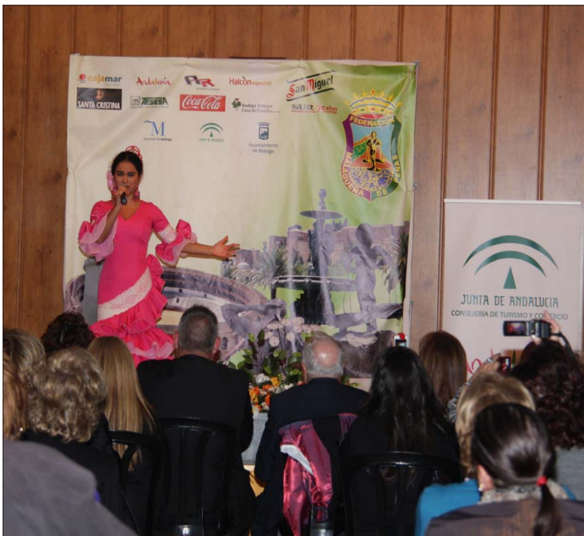
El público permaneció atento a las actuaciones de los alumnos.

Con el patrocinio de la Empresa Pública para la Gestión del Turismo y del Deporte de Andalucía, de la Consejería de Turismo y Comercio de la Junta de Andalucía, durante