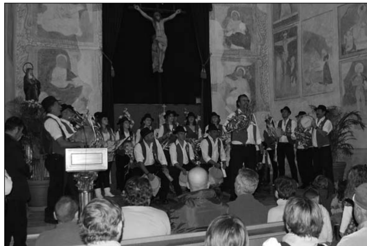
Actuación de una pastoral en el interior de la iglesia de Benaque.

de Mijas, Los Prados de Málaga, Santa Fe de Fuengirola, Totalán, La Ilusión de Puerto de la Torre, Algarrobo, Almáchar, Raíces de Colmenarejo, Almayate y por último Salvador Rueda de Benaque, la encargada de clausurar el evento. La jornada daba comienzo a partir de las 12.00 horas y se desarrolló de forma continuada hasta las 20.00 horas aproximadamente.