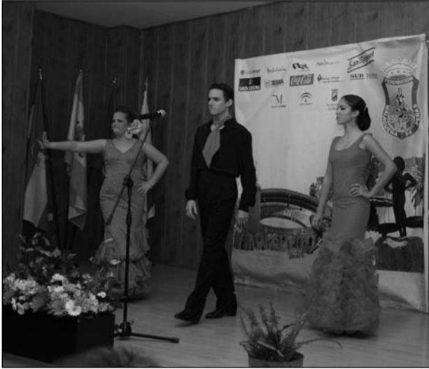
Inicio del espectáculo.