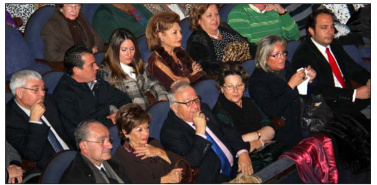
Presidencia del acto, con la presencia del alcalde.