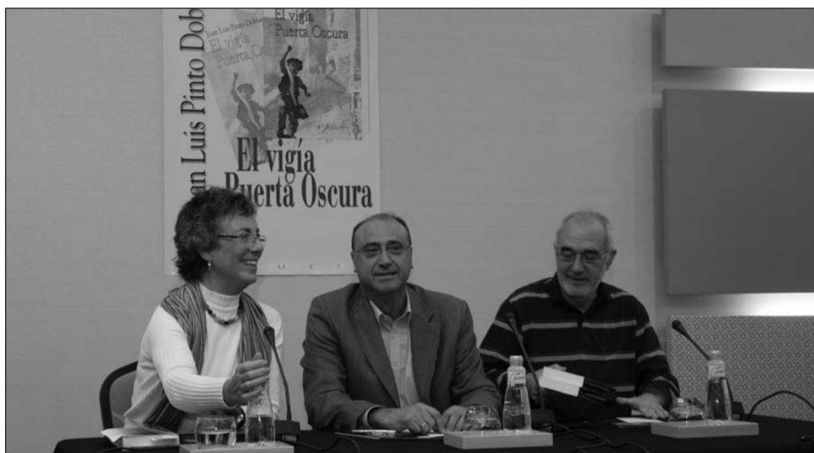
Presentación de 'El Vigía de Puerta Oscura'.