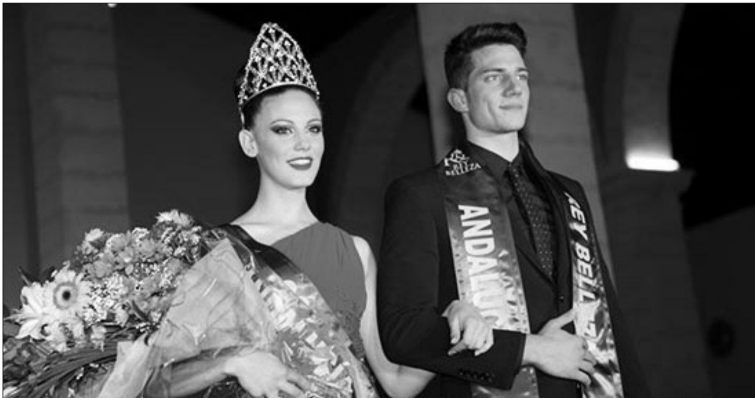
Los ganadores del certamen.

Pero no fueron los únicos premios; el I Finalista fue el chico de Sevilla; y el II Finalista el de Jaén; además, la banda a Rey simpatía se la lleva Almería, que ostenta también la de Rey elegancia; el Rey silueta, Sevilla, y Rey pasarela, Málaga. Y entre las chicas, la I Finalista fue la sevillana; la II la almeriense; y la banda de simpatía fue para Málaga; la de silueta y pasarela para Cádiz y la de elegancia, para Jaén. La belleza no sólo se vio entre los participantes, sino además entre el numerosísimo público asistente, que estuvo solícito a aplaudir y señalar con sus vítores a los que más les gustaban.