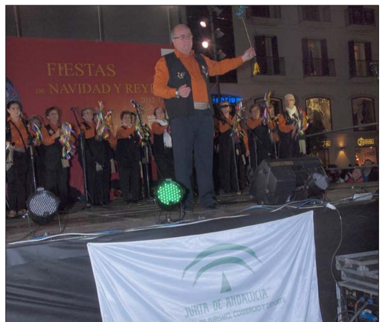
Actuación en la plaza de la Constitución.