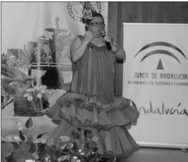
La consejería de Turismo y Comercio patrocina el escuela.