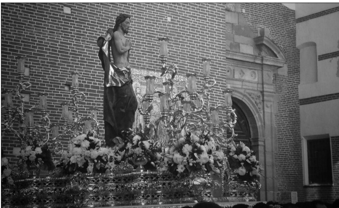
El Resucitado, en el trono de María Auxiliadora, a su paso por los Mártires.