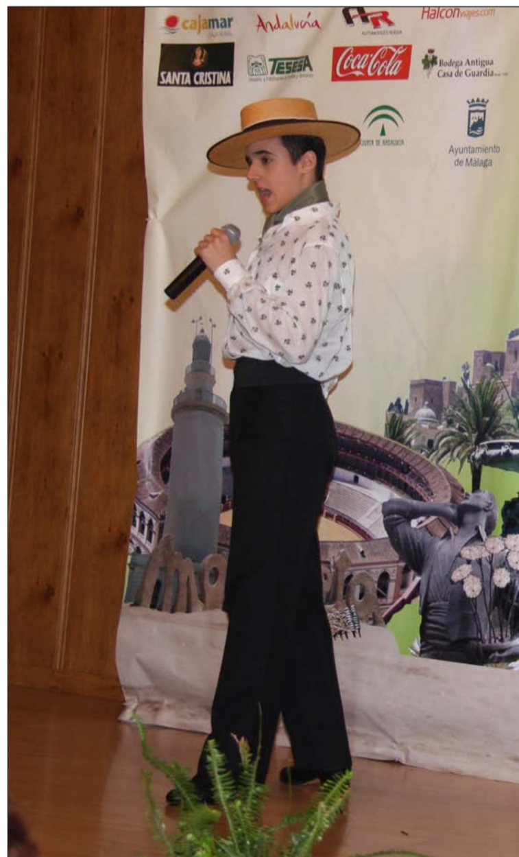
Uno de los jóvenes alumnos participantes.