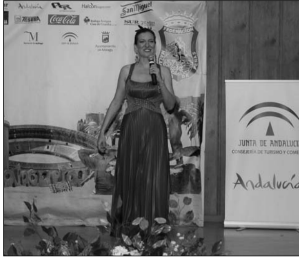
Los alumnos mostraron estilos muy diferenciados.