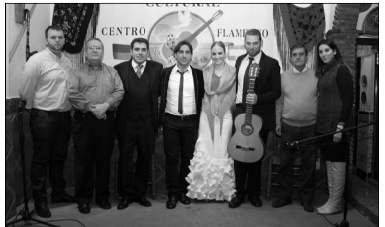
Directivos de la entidad y la Federación de Peñas, con los artistas.

Un día después, el sábado 14, los socios están citados a partir de las 16 horas para proceder a la elaboración de los tradicionales borrachuelos, y a partir de las 22 horas se contará con la actuación de la Pastoral Amigos de Santa Cristina-Centro Cultural Renfe.