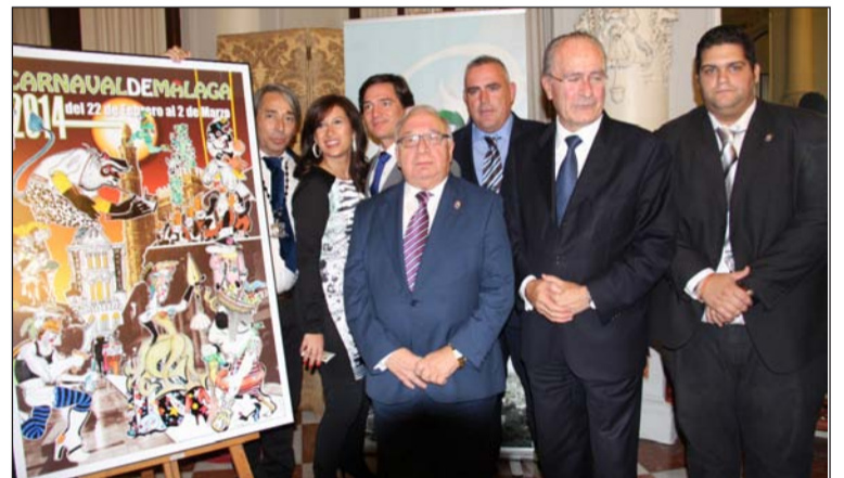
La Federación de Peñas estuvo representada en la presentación.