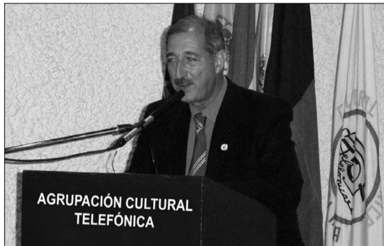
El presidente se dirige a los socios.

A la hora acordada y como es de costumbre, ambos grupos se unieron para dar buena cuenta de un buen almuerzo, una animada sobremesa y de vuelta a Málaga.