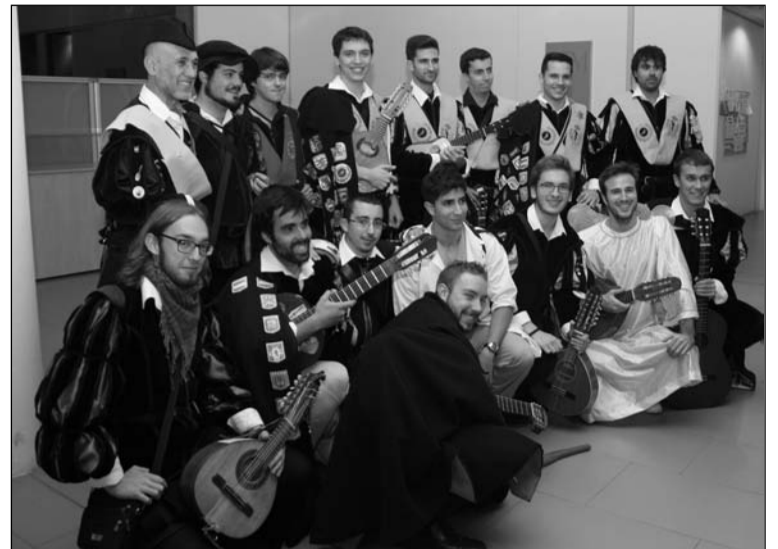
La tuna actuó.