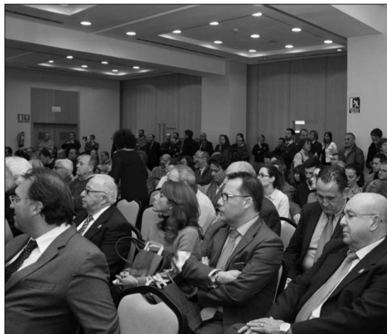
Aspecto que presentaba la sala durante la presentación.