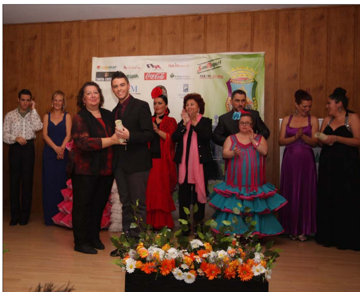
Entrega de diplomas a todos los alumnos.