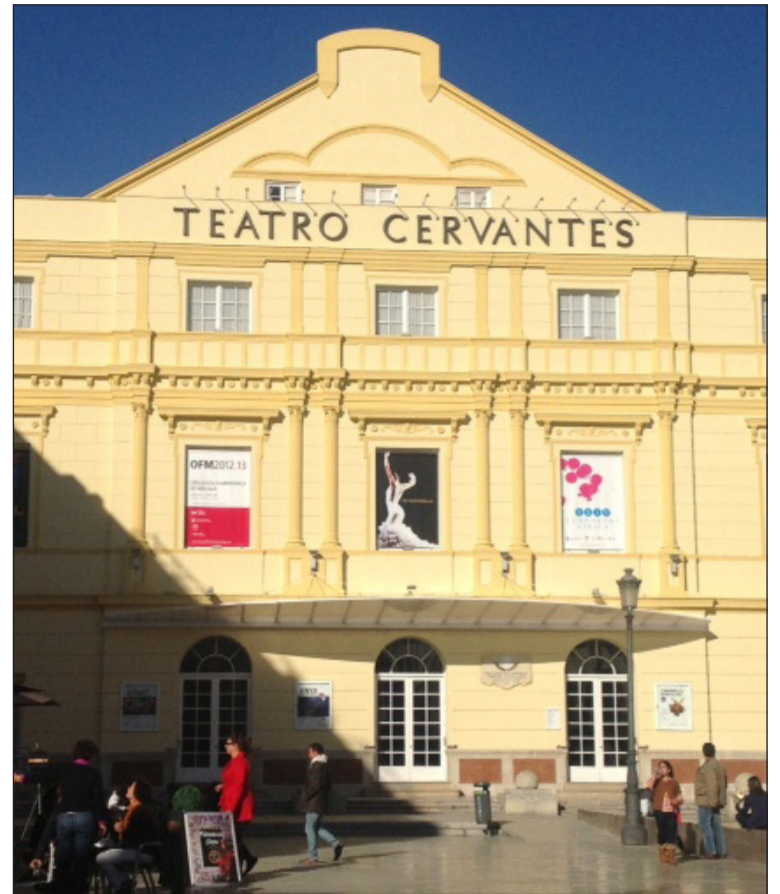
El Teatro Cervantes acogerá el próximo domingo este espectáculo.

El cartel de esta edición ha querido rendir un homenaje póstumo a la artista Marifé de Triana, fallecida en los últimos meses y muy vinculada a nuestra provincia.