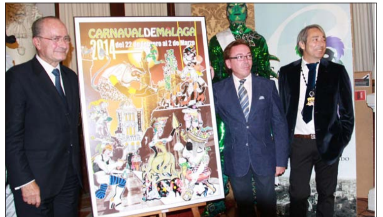
Presentación del cartel del Carnaval de Málaga 2014.