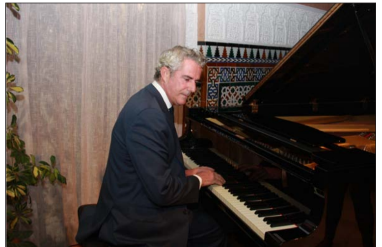
El pianista Joaquín Pareja Obregón.