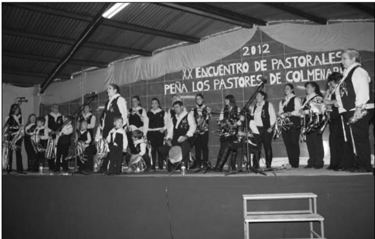
Encuentro del pasado año.

Será una jornada entrañable en la que reaparecerán los villancicos más tradicionales