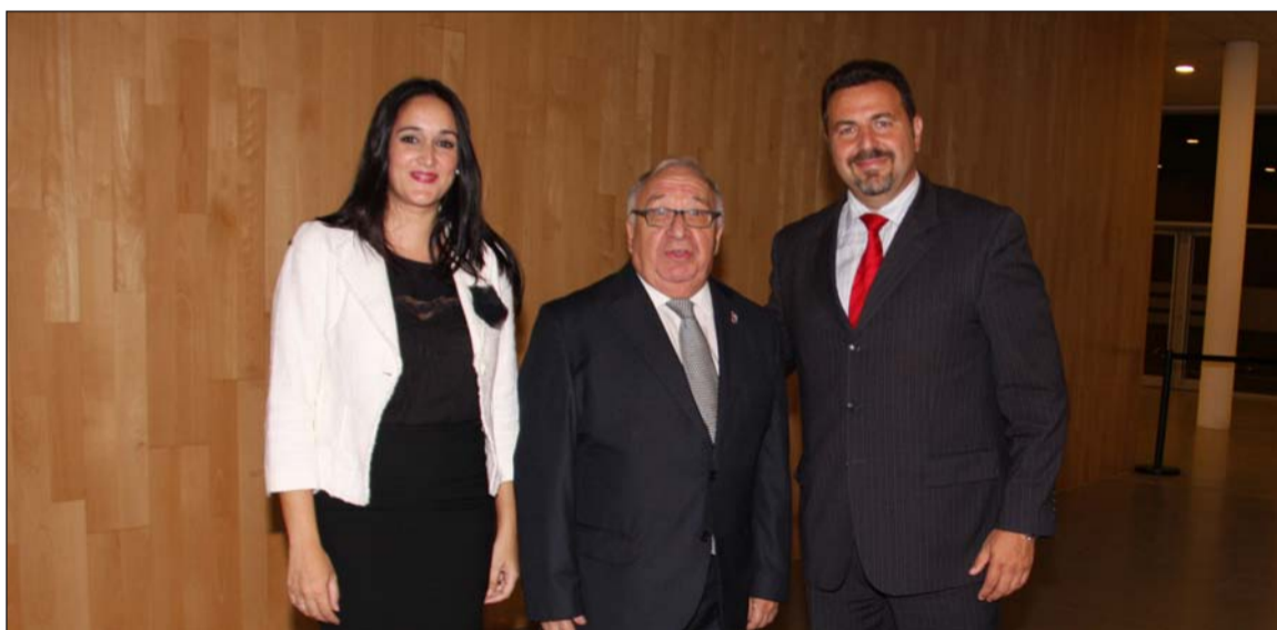
El presidente Miguel Carmona acompañó a Central Ciudadana en este acto.