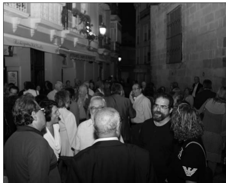
Ambiente en el exterior de la pinacoteca.

Durante la celebración, y sobre todo en la jornada del domingo, el Museo Picasso Málaga se llenó de padres con hijos que acudieron a la pinacoteca tanto para recorrer juntos las salas como para participar