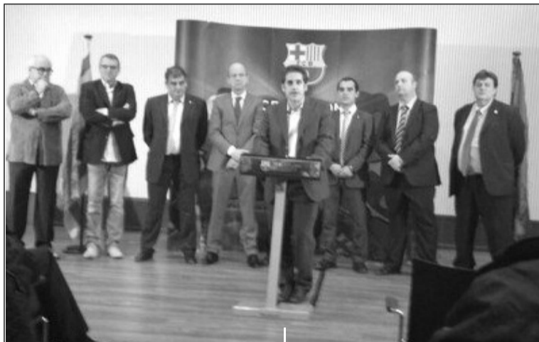
Instante de la presentación.

La expedición salio el jueves 31 de Octubre desde Málaga y regresaron el sábado, llegando a la ciudad de Málaga de madrugada.