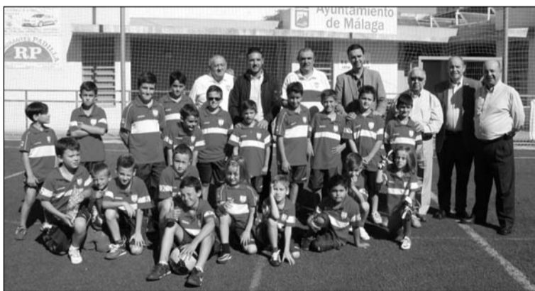
Uno de los equipos de la entidad.