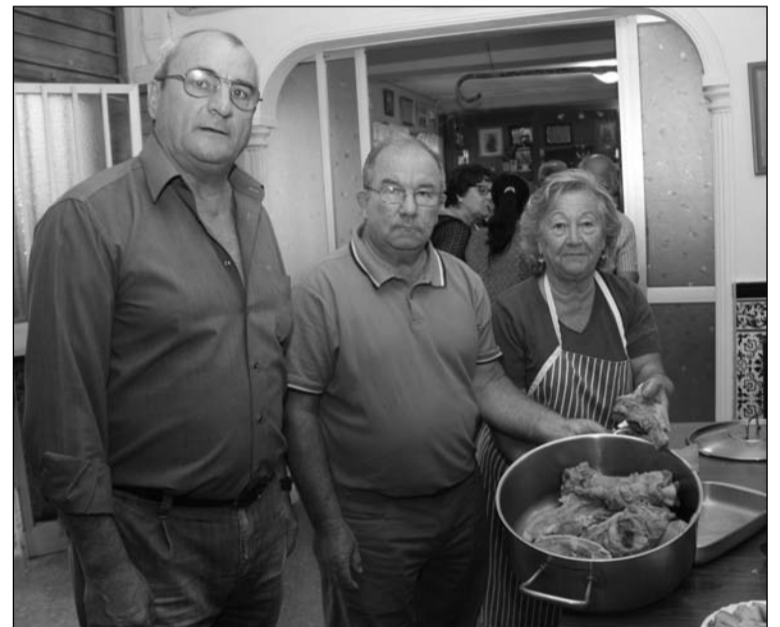
Los socios degustaron una pringá.