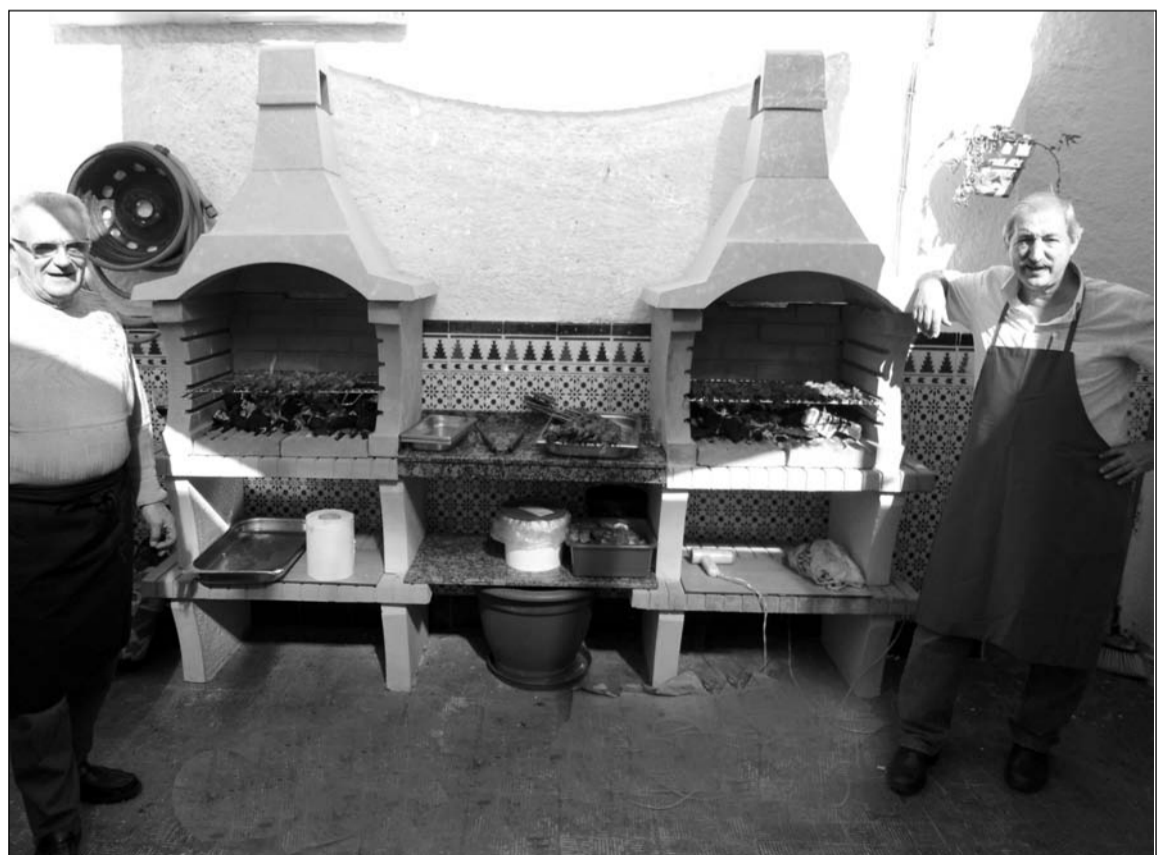
Las dos nuevas barbacoas.