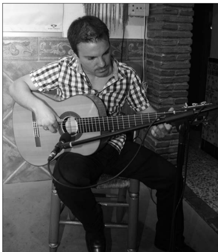
Imagen de archivo de un recital en La Malagueña.

El ciclo está enfocado a la exposición de los diferentes tipos de fandangos de cada provincia y de sus variantes y creaciones personales.