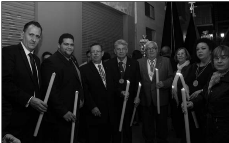
Peñistas y cofrades.