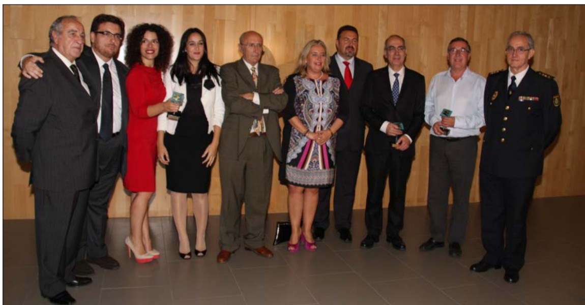
Imagen de los premiados.