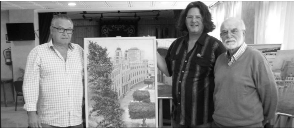
Miembros del jurado y el presidente, con el cuadro ganador.