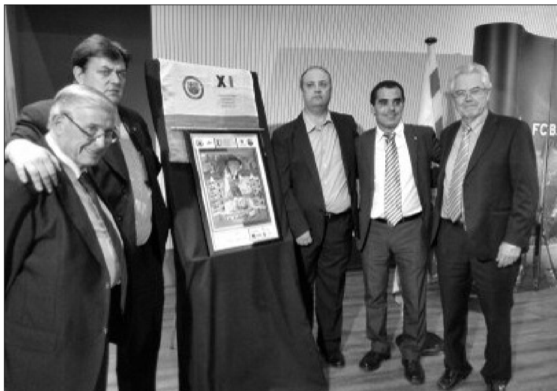
Peñistas y autoridades, junto al cartel.