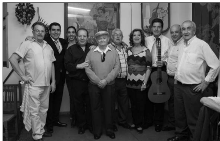
Socios y aficionados de esta entidad.