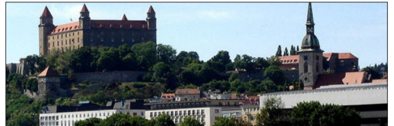
Bratislava, capital de Eslovenia.