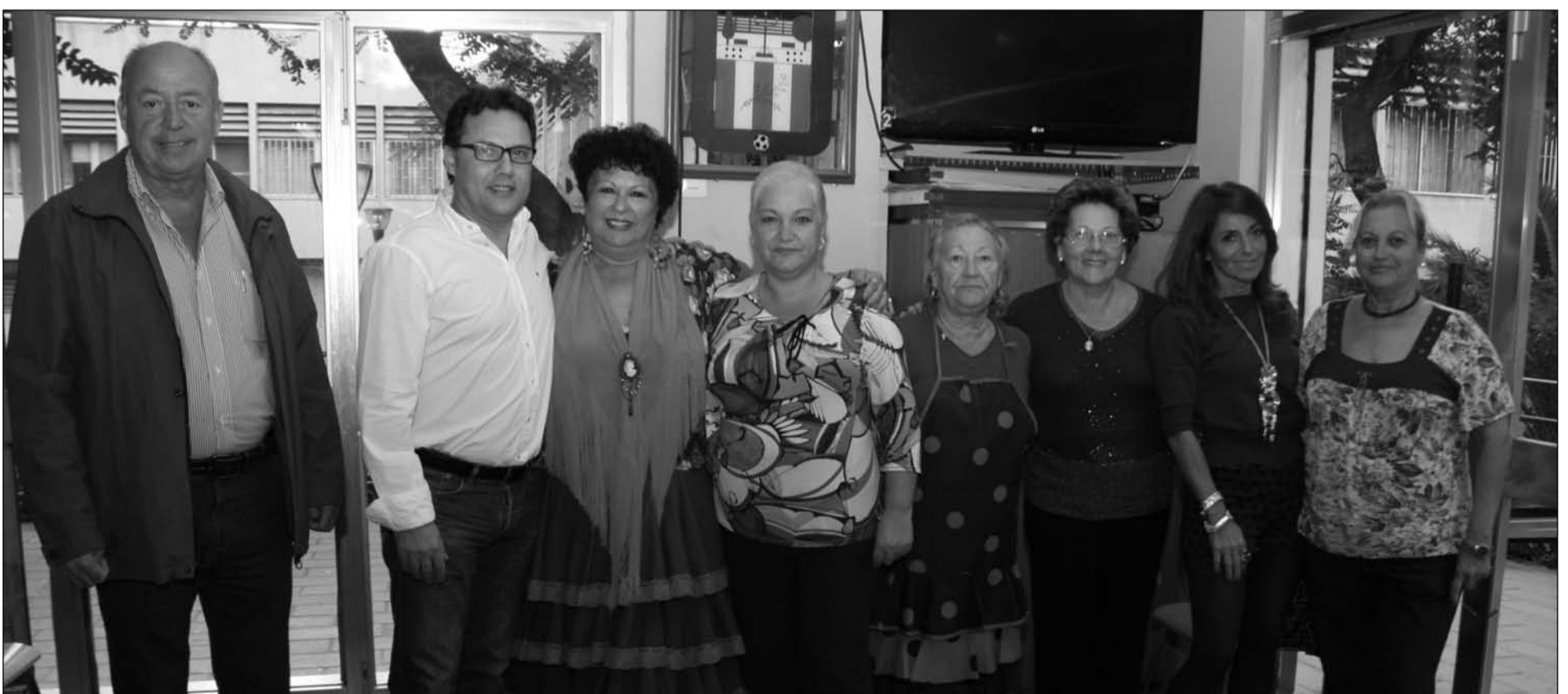
Directivos de la Federación, con la artista y la presidenta de la entidad.

Desde la Federación Malagueña de Peñas, Centros Culturales y Casas Regionales 'La Alcazaba' se está cerrando el cartel para este evento.