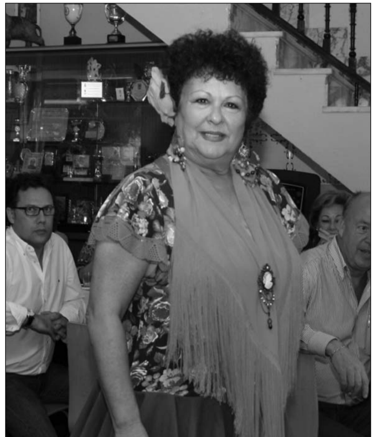
El espectáculo fue muy ovacionado.