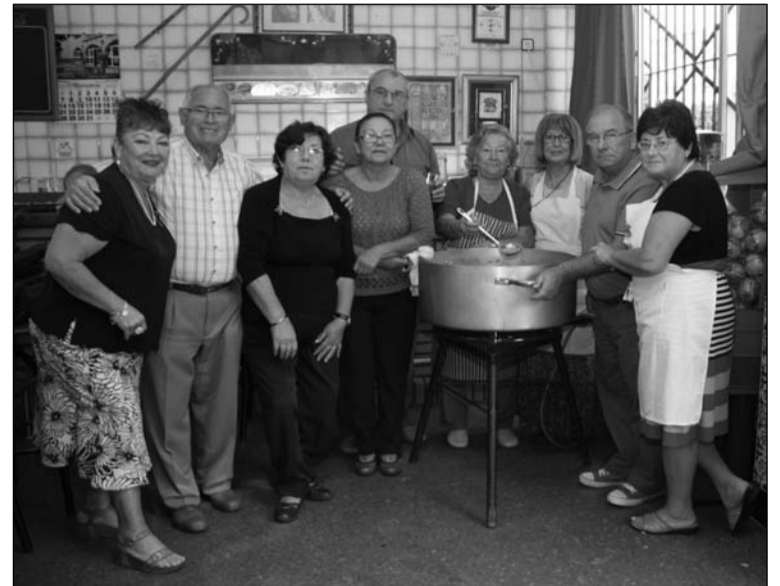
Preparativos de la Comida de Amistad.

Además, los jueves y los viernes se sigue desarrollando el curso de manualidades para socios de la Peña El Bastón.