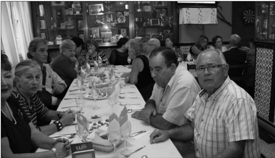
Vista del salón durante la actividad.