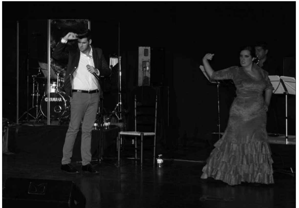
Espectáculo '10 años... a mi manera'.

El finalista de la cuarta temporada del espacio televisivo de Canal Sur 'Se llama Copla' quiso que esta gala fuera a beneficio de la Asociación Flor de Azahar.