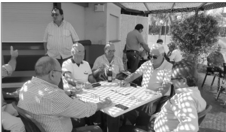
Peñistas disfrutando de la buena temperatura.