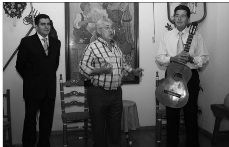
Presentación de los artistas.