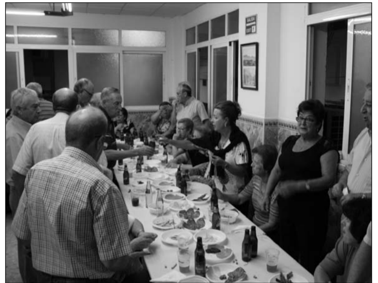
Un momento de la celebración.

Los asistentes compartieron un aperitivo que en su honor había sido presentado por la junta directiva de esta Peña.