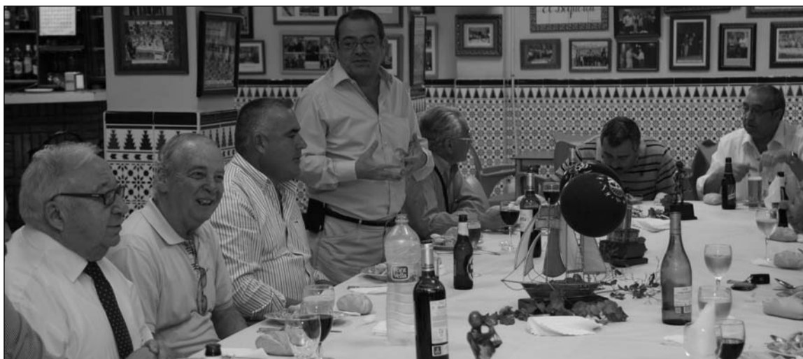
Comida de hombres del sábado.

Para esta semana está prevista una nueva comida de hermandad, siendo reservada la del 9 de noviembre para las señoras.