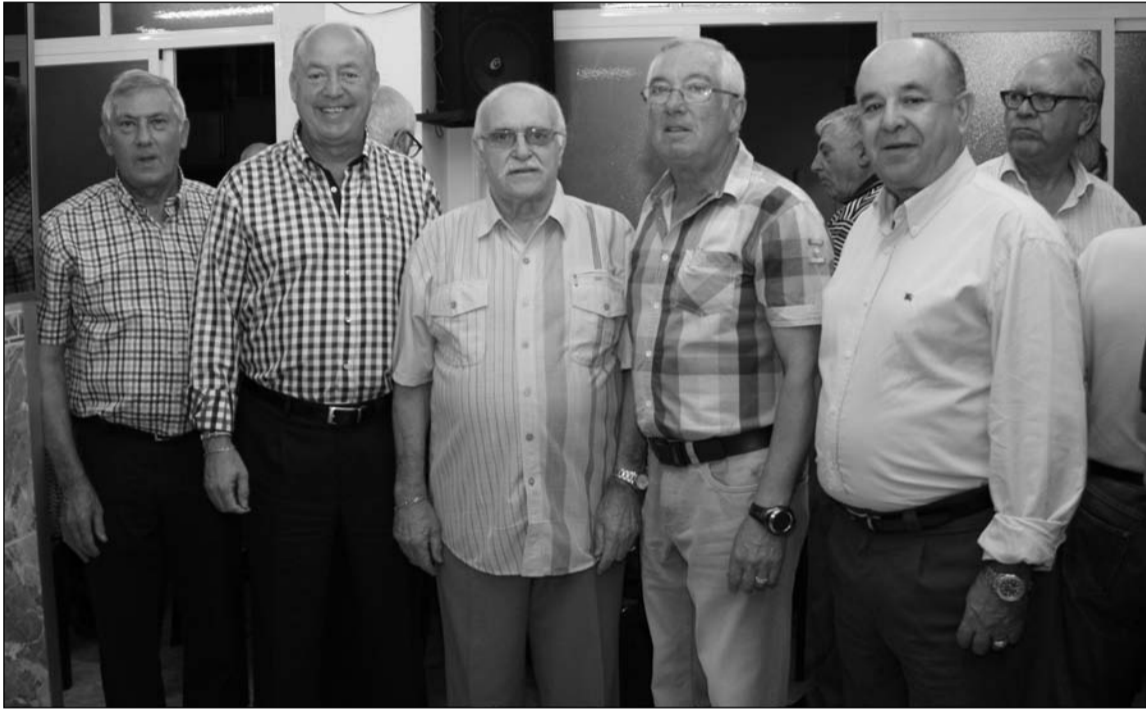
Peñista de Nueva Málaga con los representantes de la Federación de Peñas.