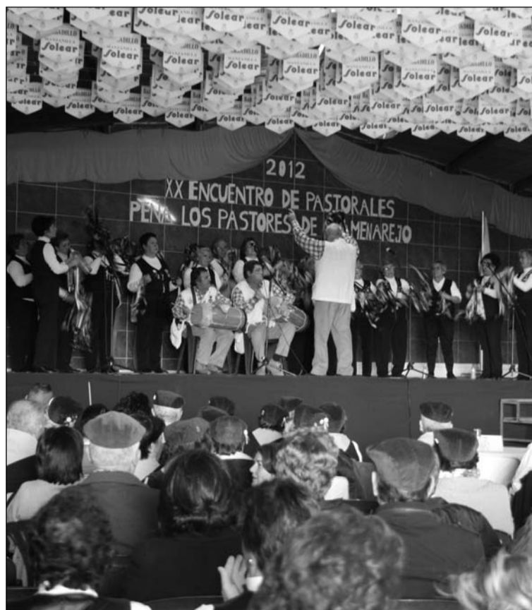
Imagen de archivo.