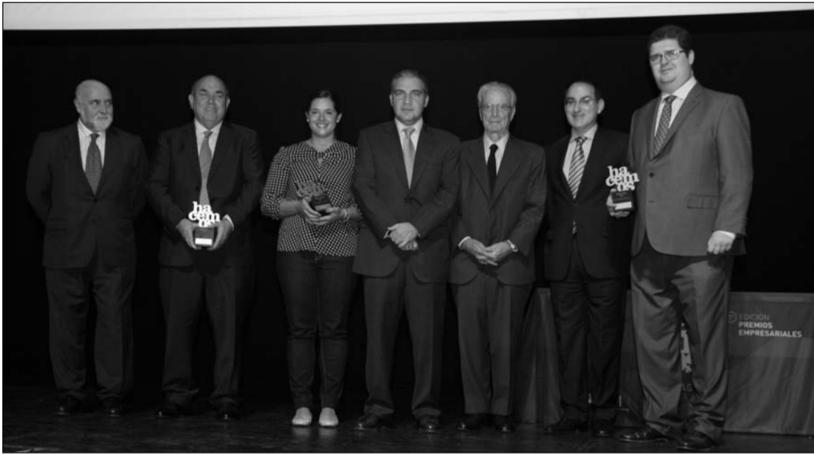
Premiados de esta primera edición.