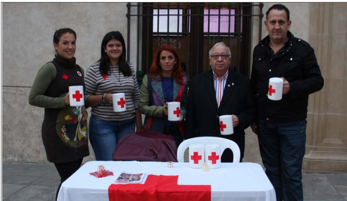
Mesa de la Federación de Peñas.

Cruz Roja informó de que gracias a la solidaridad y apoyo de la ciudadanía y del tejido empresarial malagueño en las distintas campañas de captación de fondos, en lo que va de año ha podido atender a casi 11.000 personas en riesgo de exclusión, un 86% más que en el mismo periodo de 2012, y de las que casi el 66% son mujeres.