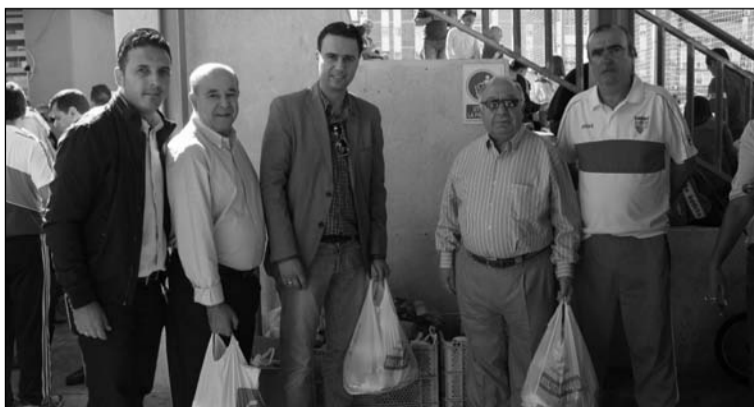
Recogida de alimentos.