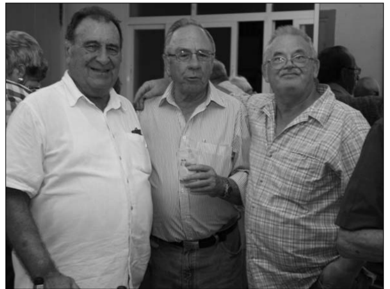
Los socios disfrutaron de la actividad.