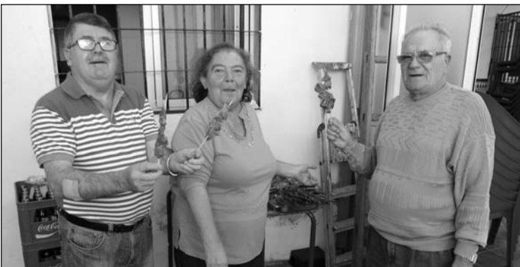
Socios con los pinchitos que se degustaron.

Más de cien socios y socias, amigos y amigas se dieron cita en la sede de la entidad y degustaron los productos que salían de los hogares y preparándose para las próximas fecha en las que el frío y las fiestas están a la vuelta de la esquina.