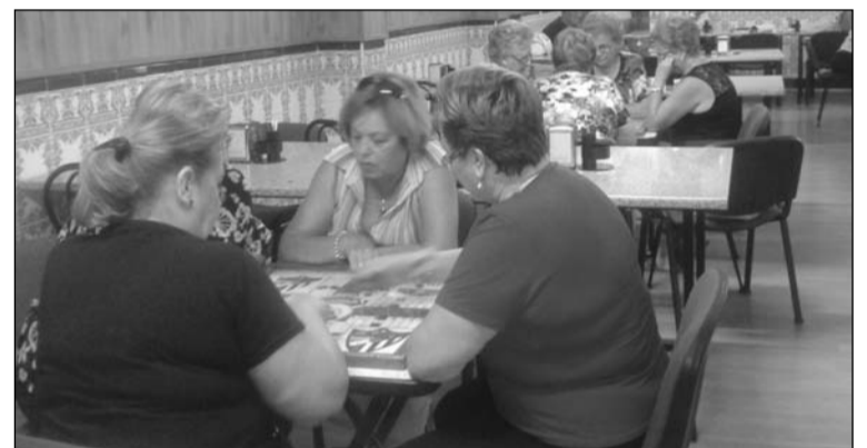
Campeonato de parchís.