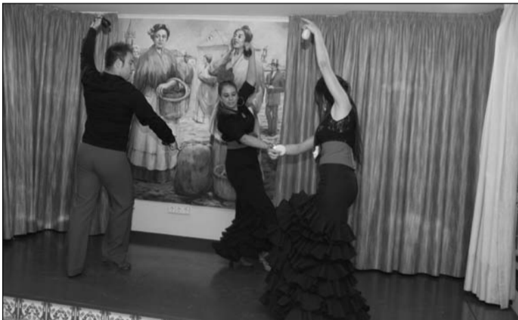
Actuación de baile.