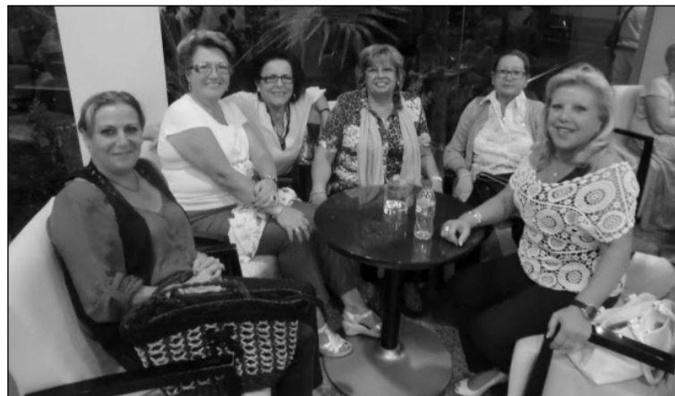
Un grupo de señoras de la entidad.