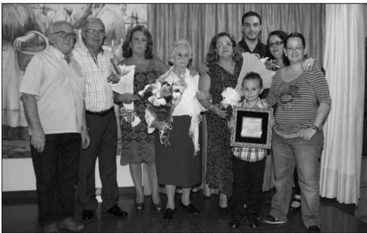
La familia del homenajeado.