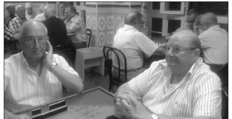
Campeonato de dominó.

juego será de todos contra todos, y la entrega de premios tendrá lugar en el transcurso de una Cena de Gala que se servirá el 8 de marzo de 2014 en el hotel Elimar de Rincón de la Victoria, donde habrá actuaciones y baile.