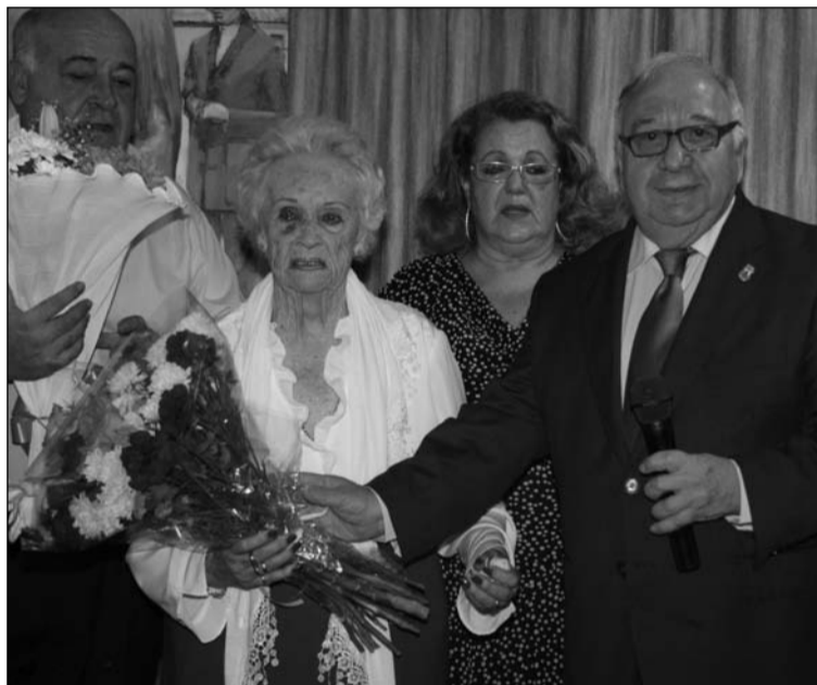
El presidente de la entidad y el de la Federación, con la viuda y su hija.

Las actividades principales del mes de noviembre para la Peña Recreativa Trinitaria pasan por una excursión a Almonte (Huelva) para visitar a la Virgen del Rocío los días 16 y 17.