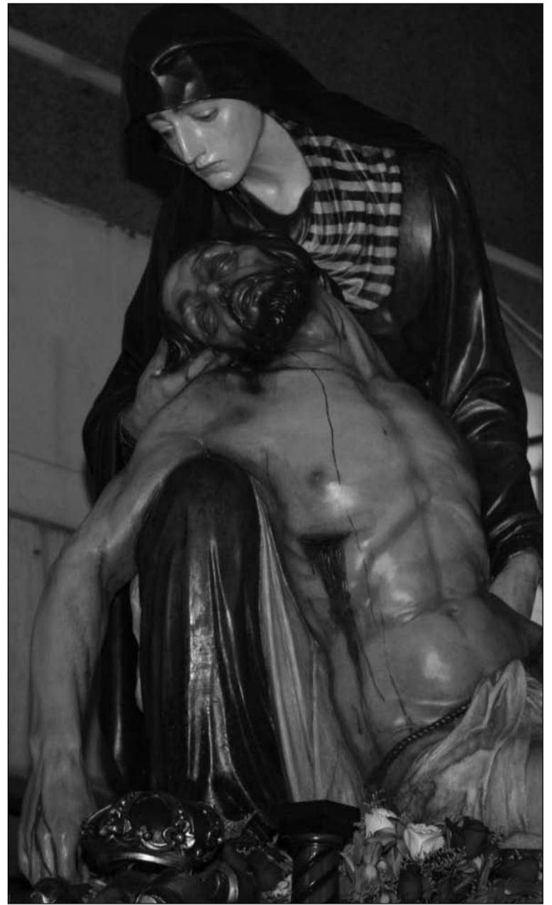
Bella talla realizada por el imaginero Francisco Palma Burgos.