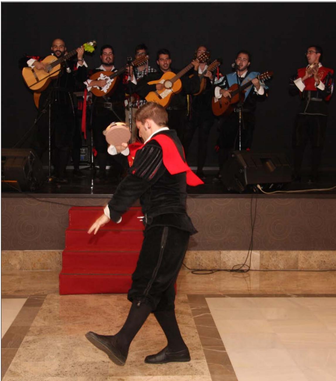
La tuna, que ya actuó en el Día del Mayor, volverá a estar presente en el Aniversario.