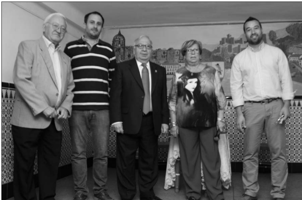
Acto del pasado viernes.