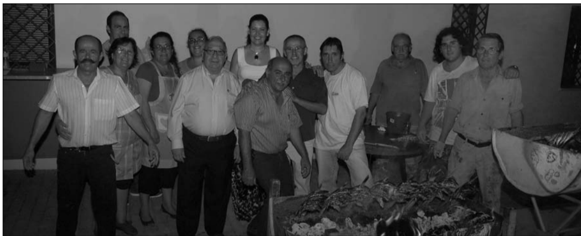
Los propios socios fueron los encargados de preparar las sardinas.