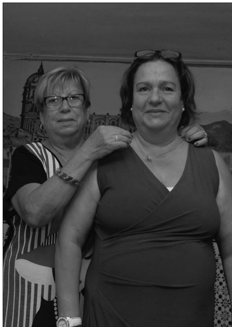
El Escudo de Oro de Pilar Villanueva fue un colgante.