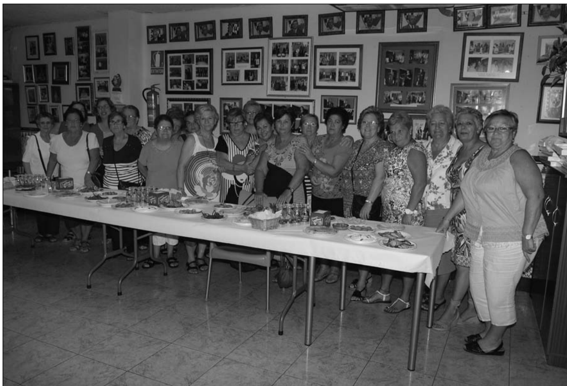
Asistentes al acto.

Por otra parte, para el 6 de octubre está prevista la celebración de una comida de hermandad.