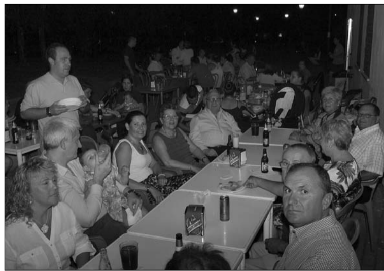
La sardinada se celebró en el exterior de la sede.