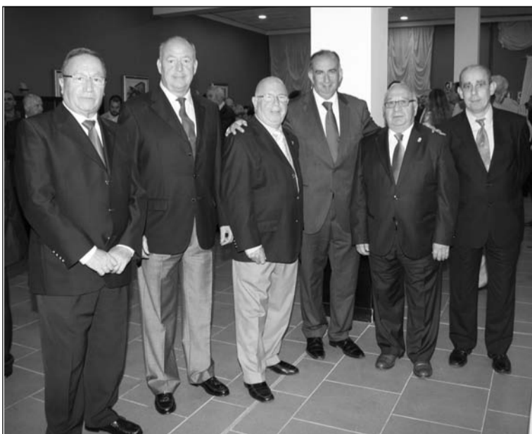
El presidente, con representantes del tejido asociativo malagueño.

En su discurso de investidura hizo mención a los recortes sanitarios. Aseguró que la profesión médica va a superar la política de recortes “que estamos sufriendo y lo vamos a hacer posible por la vocación que nos inspira y el deseo de que el destinatario final de nuestro trabajo, el paciente, continúe viendo en nosotros al médico que pretende ayudarle a mitigar su enfermedad”.