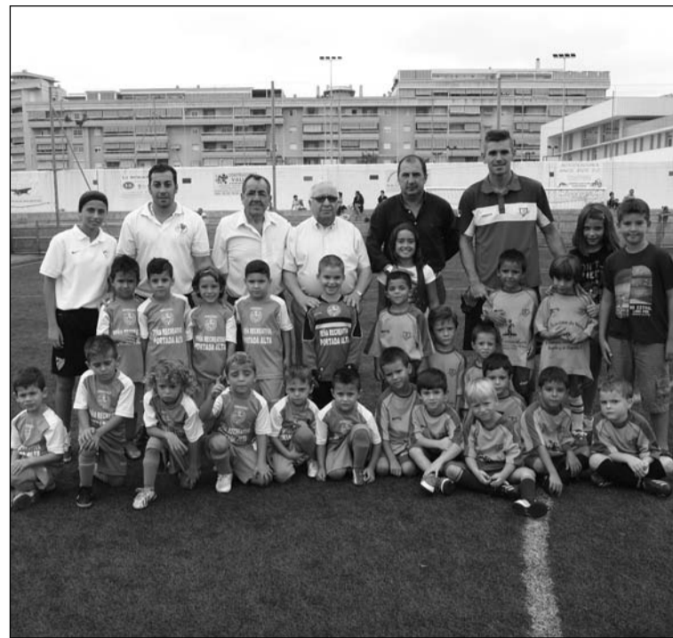
Algunos componentes de la Escuela de Fútbol.

Desde esta entidad federada también se anuncia a sus socios que a partir del día 3 de noviembre está programado un viaje al País Vasco y País Vasco Francés. La duración es de 6 días y 5 noches.