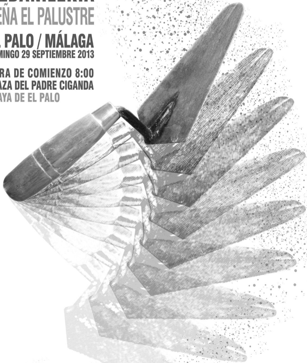
Cartel de esta edición

HORA DE COMIENZO 8:00 PLAZA DEL PADRE CIGANDA PLAYA DE EL PALO