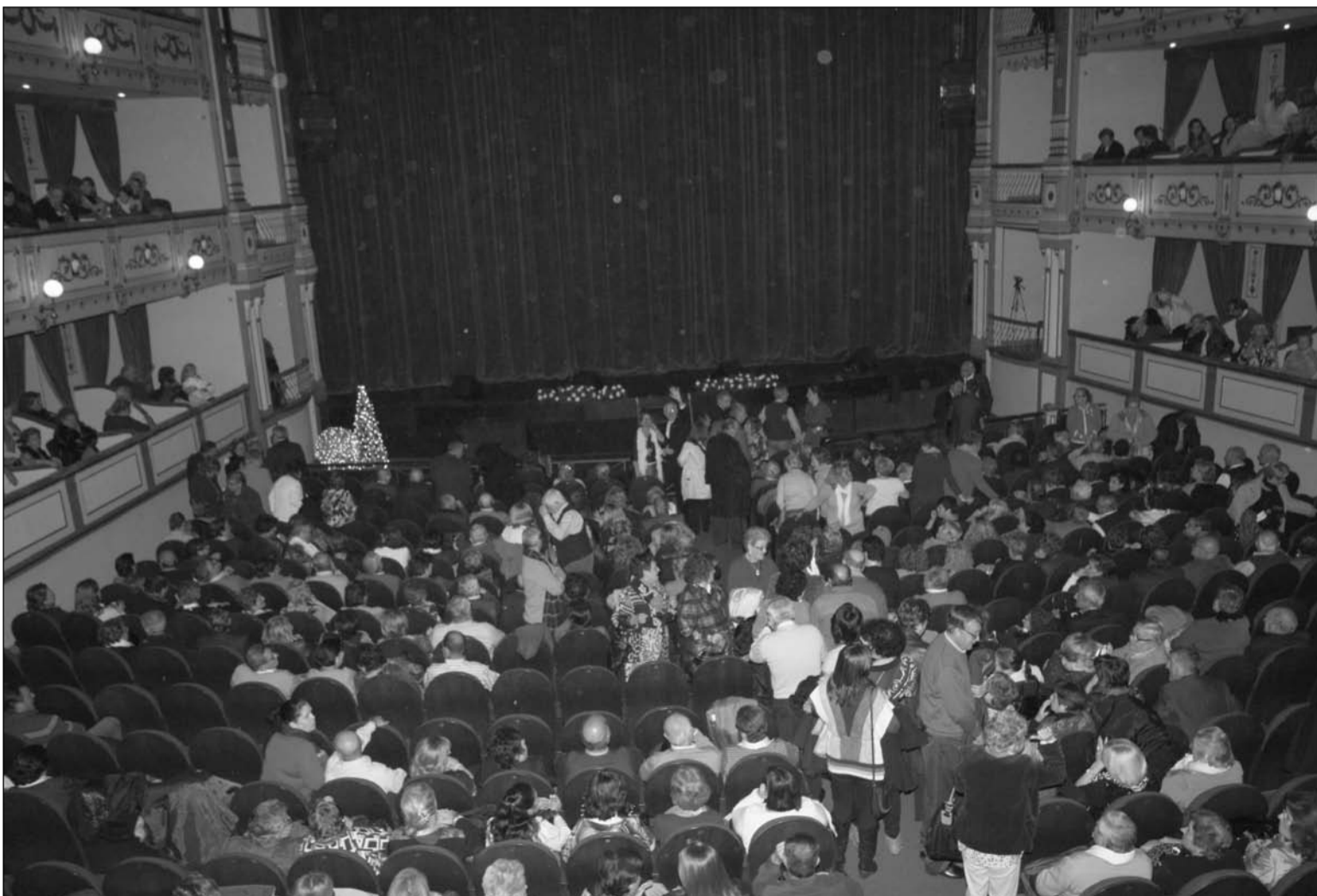
Aspecto del teatro Cervantes instantes antes de comenzar Málaga Cantaora 2012.

La Clausura de Málaga Cantaora en un evento que cuenta con una gran demanda de público, por lo que a distribución de las localidades disponibles se realizará de un modo gratuito entre todas las entidades interesadas.