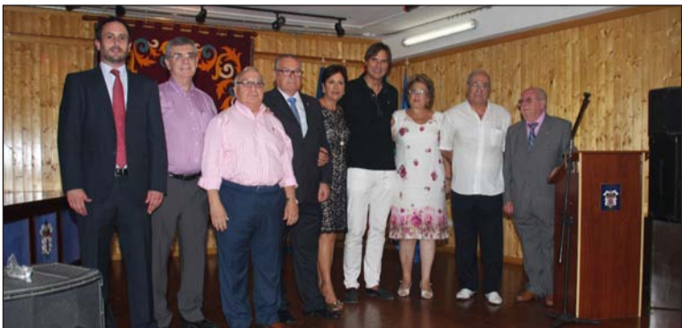
Asistentes al acto.