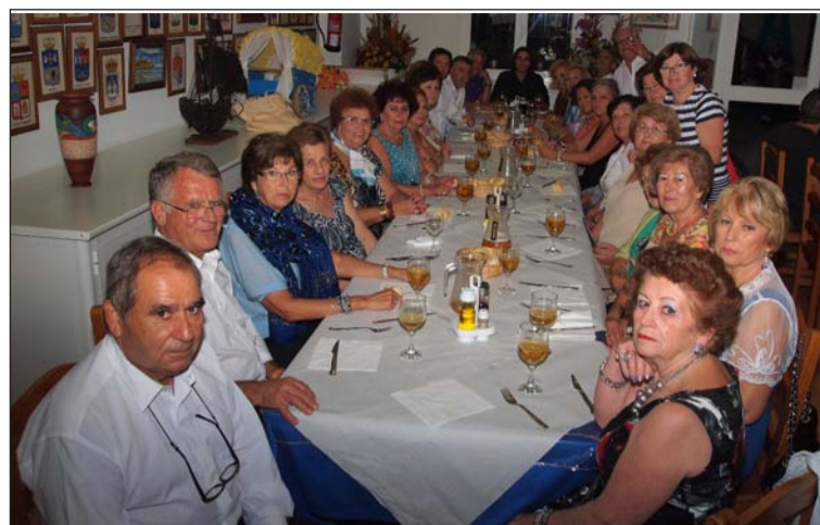
Asistentes a la cena del viernes.

Los actos de esa jornada se cerraban esa misma noche con una cena en homenaje al pregoneiro, en la que también participó el