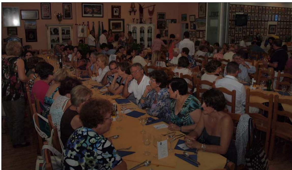
El sábado al mediodía se celebró la comida del socio con el reparto del Bollu Preñau.