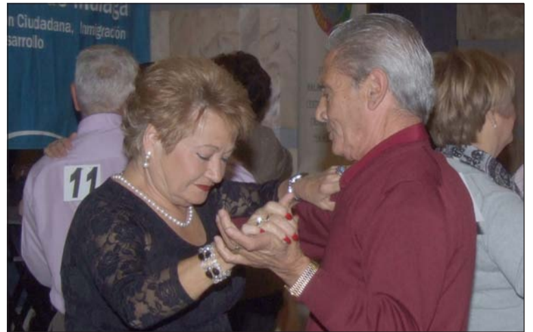
Una pareja baila en el Concurso de Pasodobles.