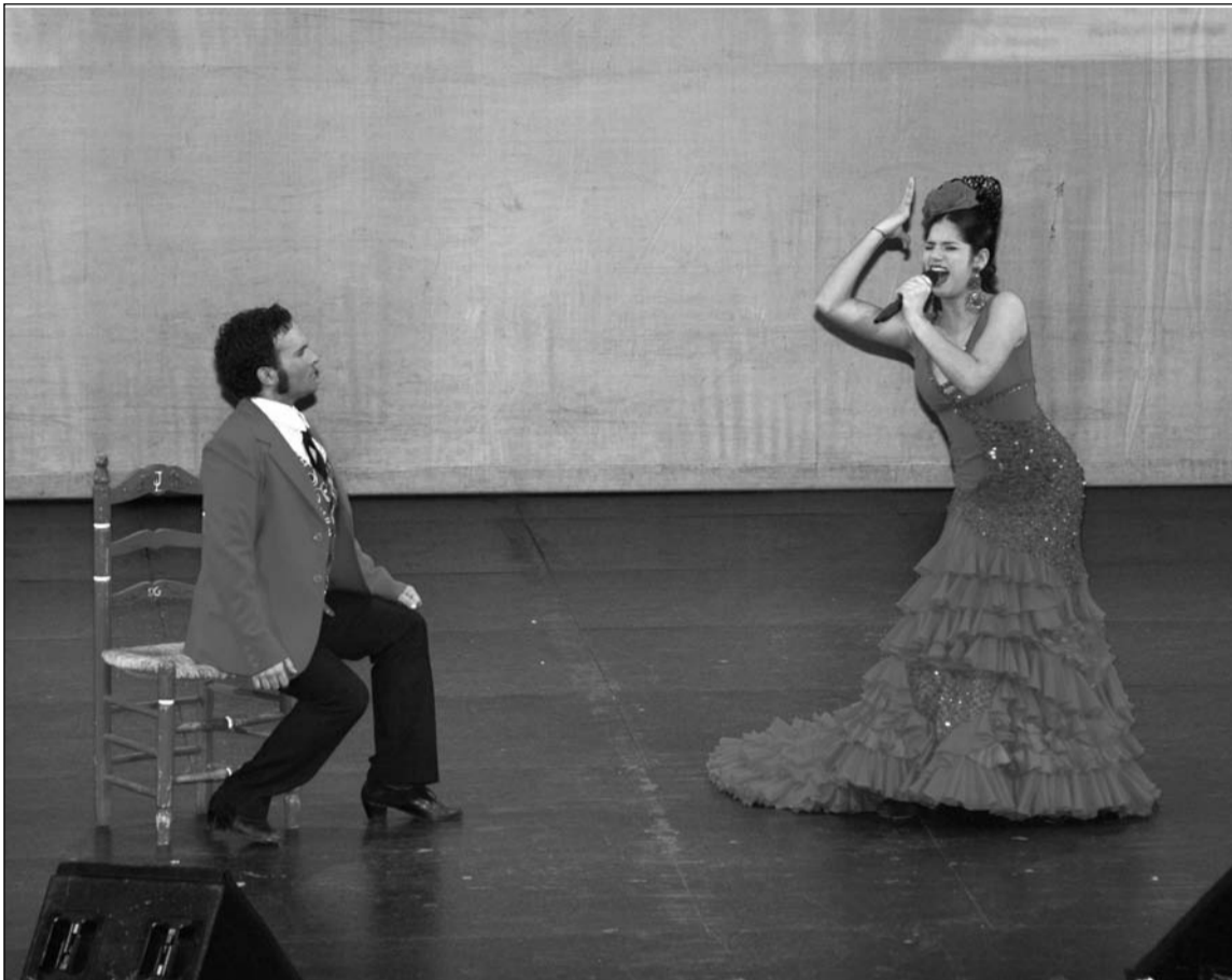
Imagen de archivo de la clausura del pasado año.