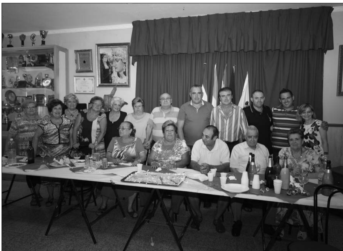
Asistentes a la actividad.

había una representación de la Peña Orgullo Malaguista Amigos de Bokemán, de la que la Peña San Vicente es padrina y a la que está cediendo sus instalaciones en sus orígenes. Así, desde esta nueva entidad se quiso agradecer la inestimable colaboración que están recibiendo.