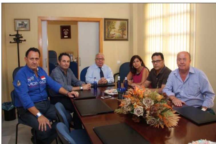
La concejala y el director de distrito, reunidos con parte de la directiva.