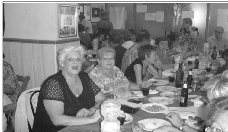
Un instante del aniversario.