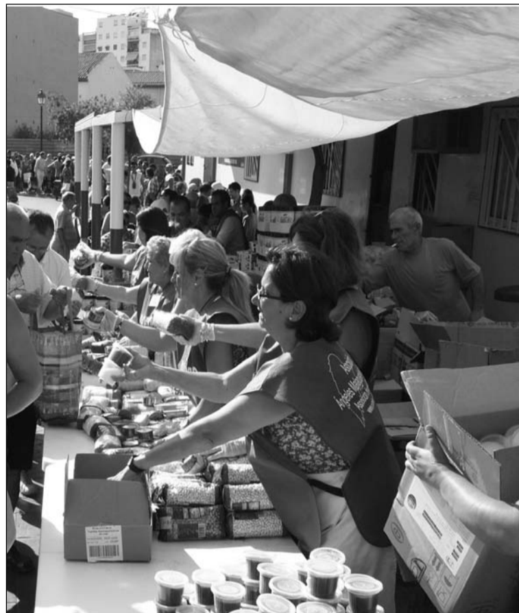
Voluntarios de los Ángeles Malagueños.

Desde el Ayuntamiento de Málaga se ha cedido a esta asociación un solar situado en la calle San Pablo, pero para poder construirlo hace falta la colaboración de todos los malagueños. Así, se ha fijado un precio simbólico de un euro por cada ladrillo; pudiéndose realizar los ingresos en la cuenta corriente de Unicaja 21033034 42 0030013426