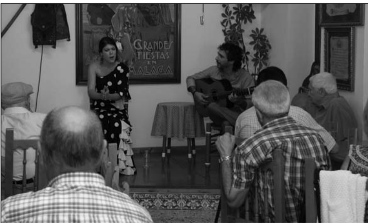
Un instante del recital.