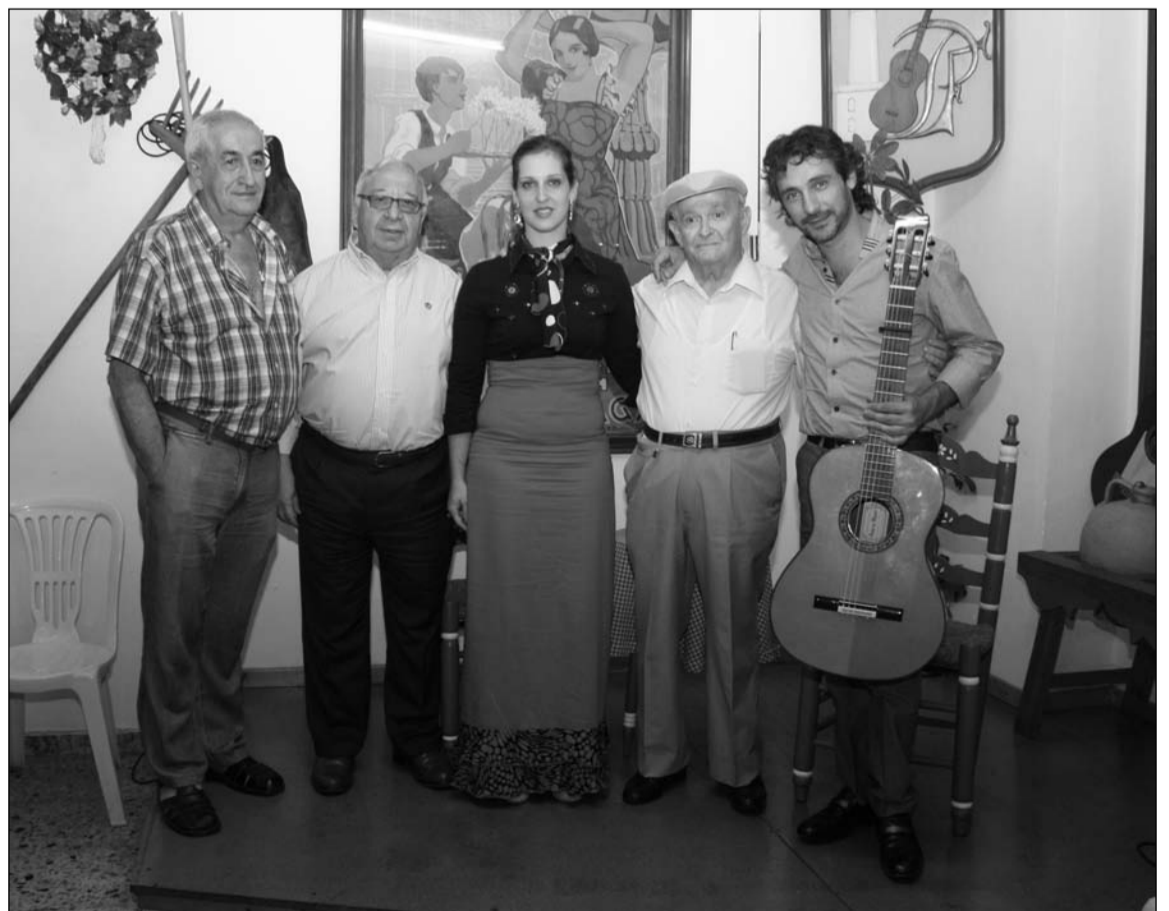
Imagen del acto celebrado en la sede de la Peña Flamenca Fosforito.