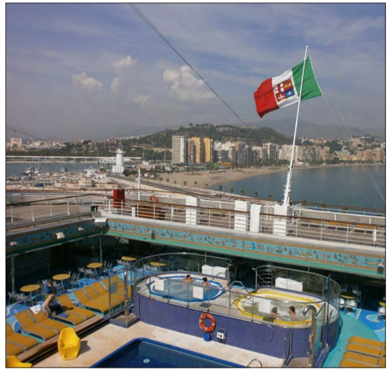
Vista de una de las cubiertas del Costa Fortuna.

Los cubiertas con excepcionales vistas, sus piscinas, jacuzzis, bares y restaurantes, el gimnasio en la proa, o el gran teatro fueron algunas de las instalaciones que más sorprendieron a los visitantes, sobre todos a los que nunca habían visitado o viajado en un crucero así.