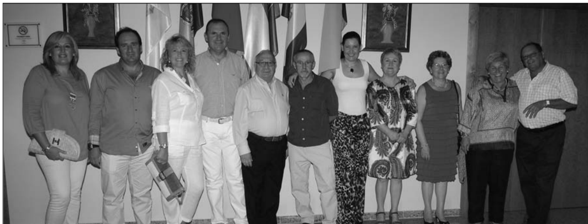
Algunos de los asistentes, en el interior de la sede.