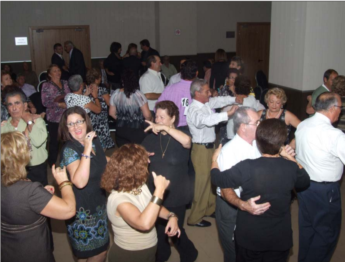
Imagen de archivo de una edición anterior del Día del Mayor.