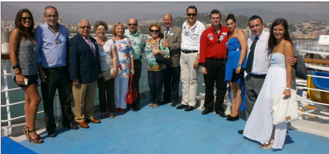
Representantes de la Federación de Peñas, en la cubierta, con la ciudad de fondo.