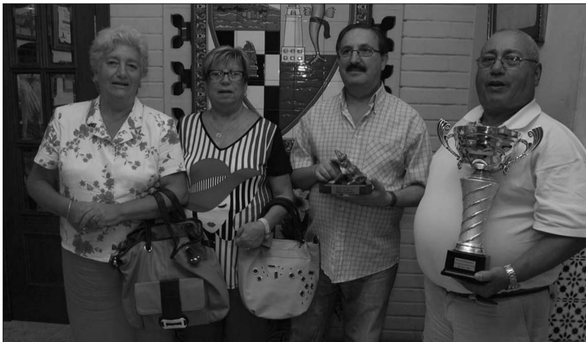
Ganadores de los diferentes torneos.

El acto concluía con un aperitivo, "y mucha alegría", tal y como se indicó desde la entidad.