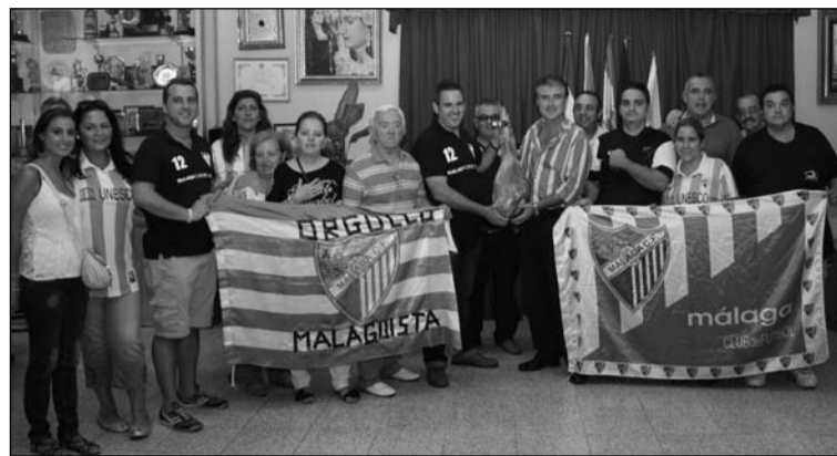
Hermanamiento con la peña malaguista.