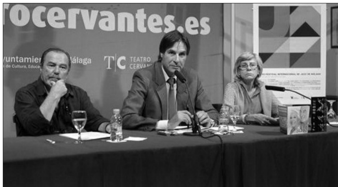
Rueda de prensa ofrecida la pasada semana.