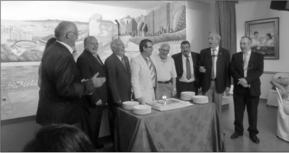
Momento de soplar las velas de la tarta de aniversario.