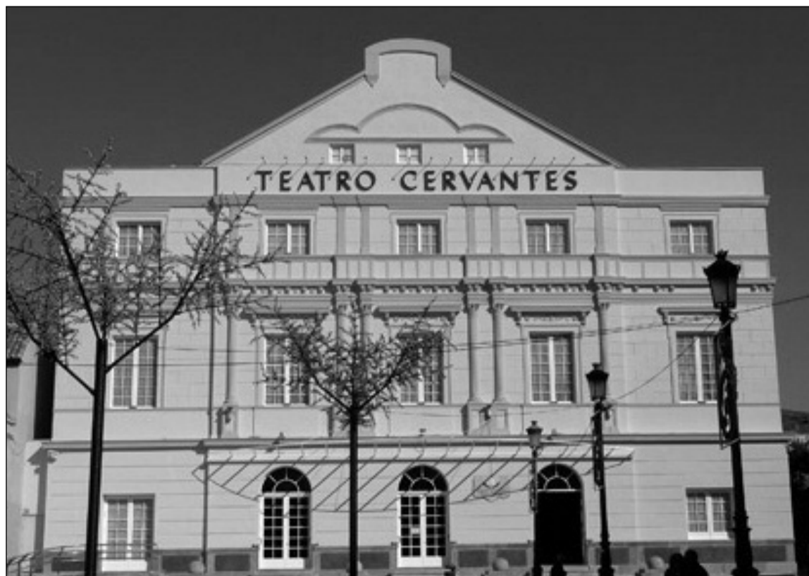
Imagen del Teatro Cervantes.

El primer gran ciclo del Cervantes, el Festival Internacional de Jazz, alcanza su XXVII edición con una compacta programación comandada por el mago del Hammond Lonnie Smith, el saxofonista Eric Alexander, el trío polaco Kroke y la revisitación del legado de Nino Rota del italiano Enrico Pieranunzi. Será entre el 4 y el 10 de noviembre.