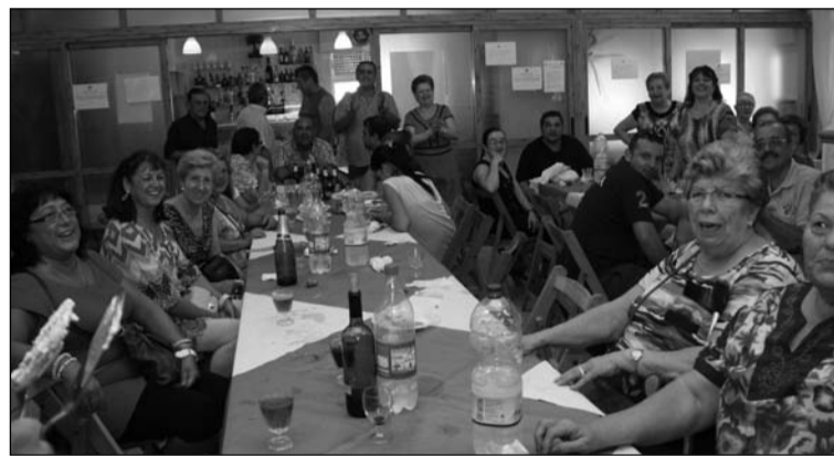
Vista del salón durante la comida.