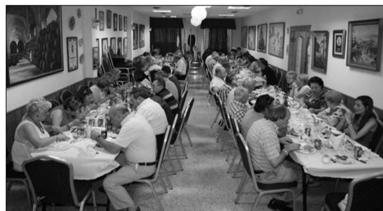
Imagen de archivo de una comida de hermandad en la Peña El Parral.