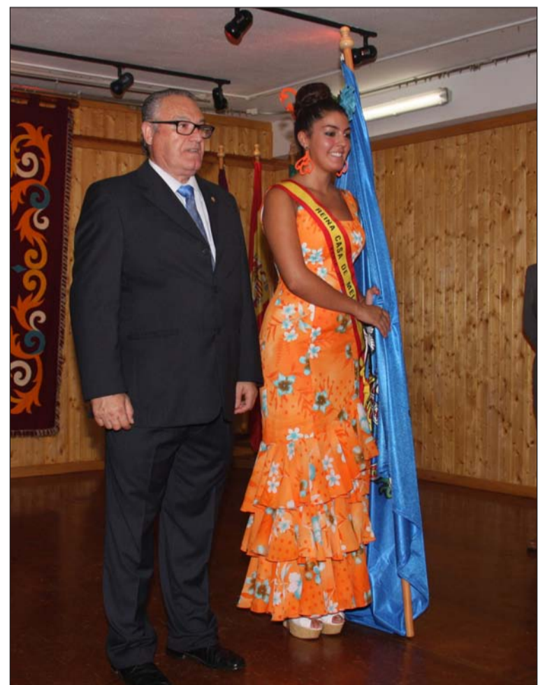
El presidente con la Reina de la entidad.