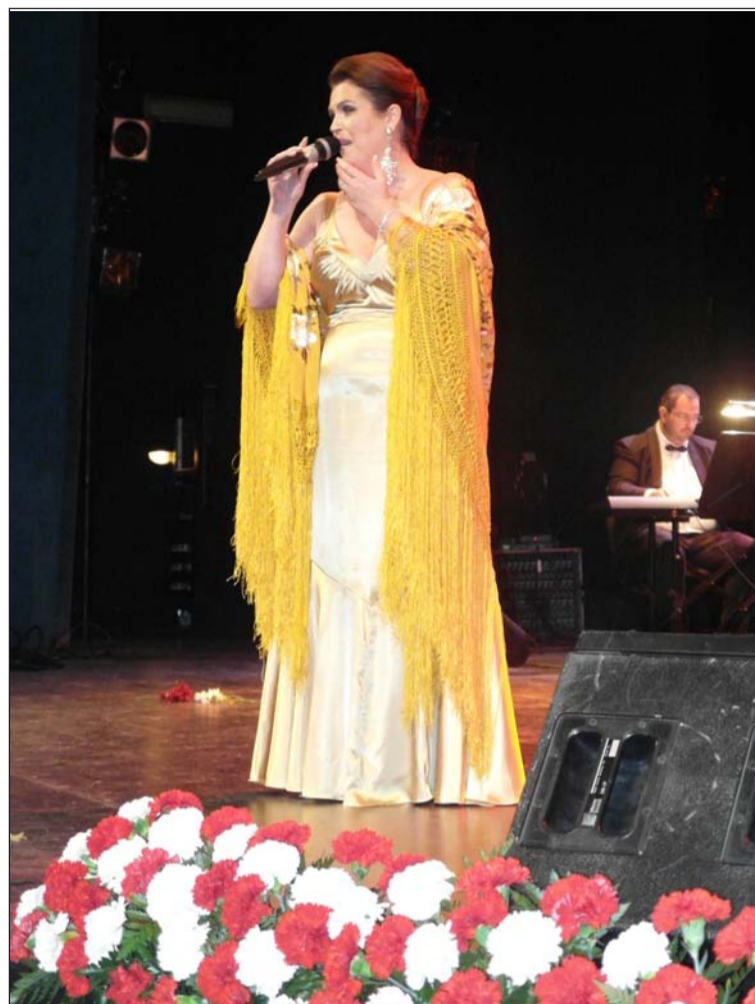
Imagen de archivo de la final de la pasada edición.

deberán traer preparados cinco temas para evitar repeticiones. El orden de actuación, así como la elección de los temas en caso de coincidir, se hará por sorteo.