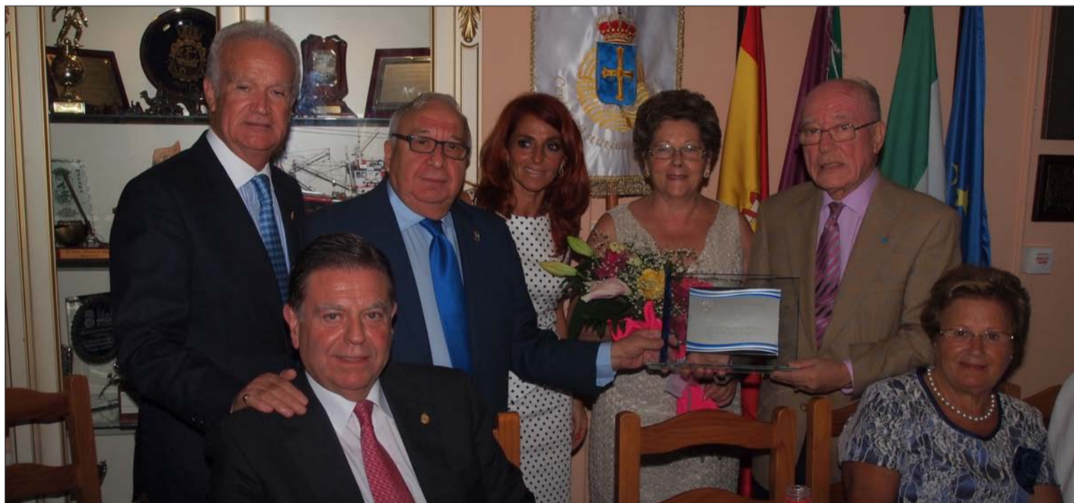
El presidente de la Federación, con representantes de este colectivo, el presidente del Centro Asturiano, el pregoneiro y autoridades.

A las 14:30 se servía una comida de hermandad para socios que era amenizada por la Banda de Gaitas 'Brisas de Asturias', el Agrupación 'L'Alborá', y la Agrupación Músico Vocal 'Cuarentuna'.