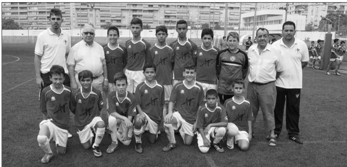
Uno de los conjuntos del Atlético Portada Alta.