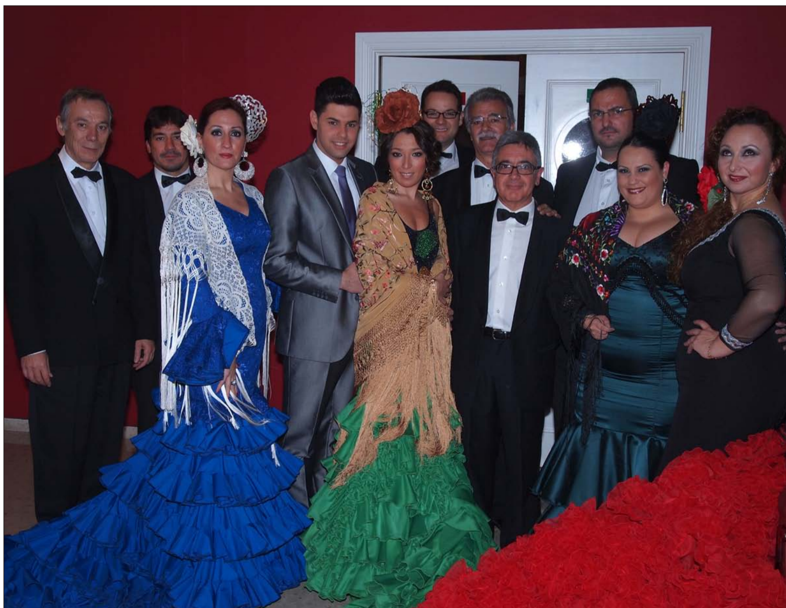
Algunos de los finalistas junto a la orquesta.