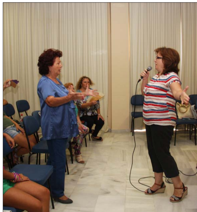
Un instante de las clases.

Hay cosas que son exclusivamente malagueñas