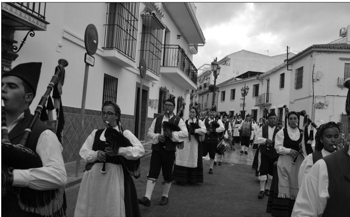
Pasacalles previo, con el grupo asturiano.