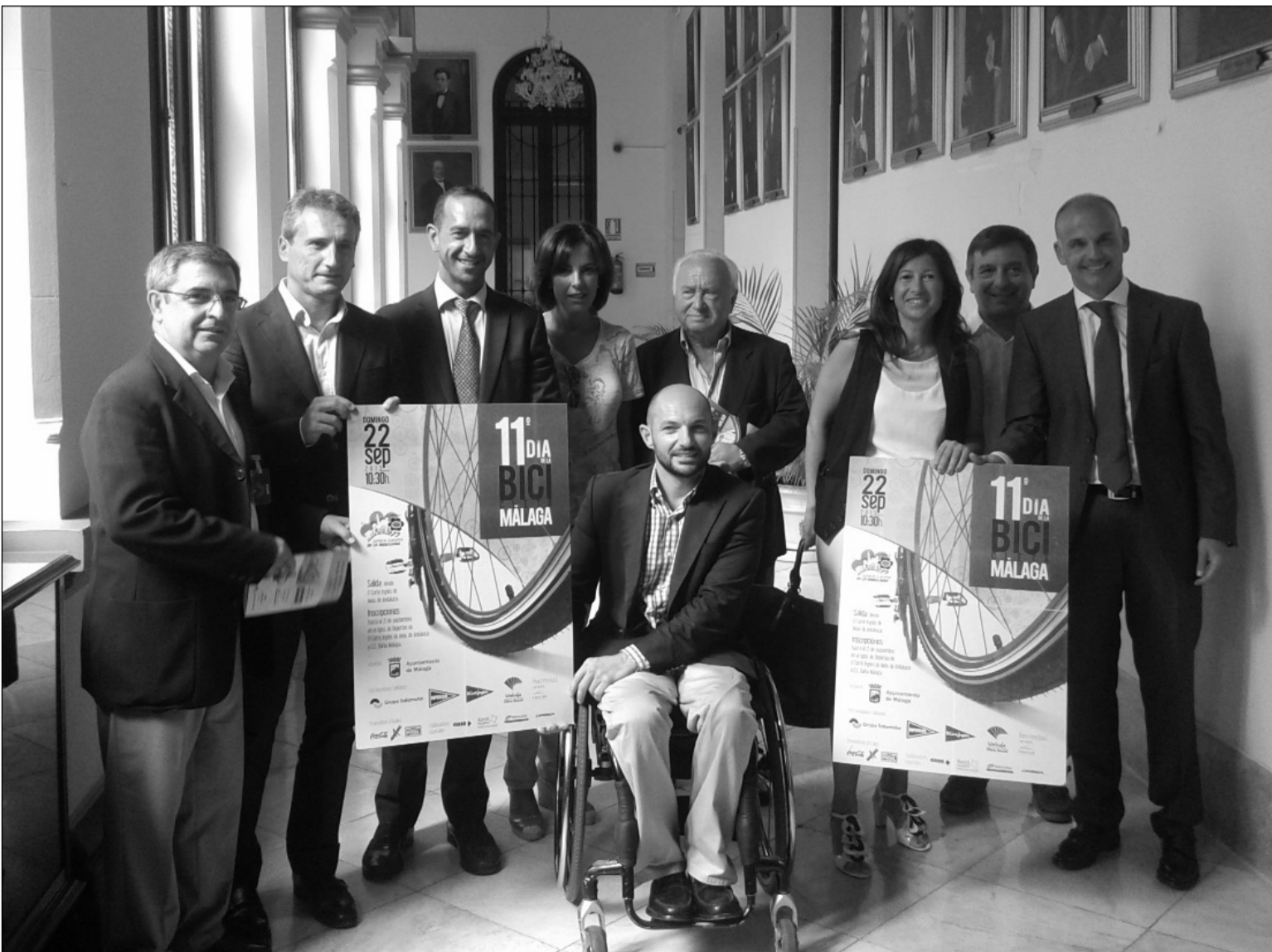
Presentación del Día de la Bici, con organizadores y patrocinadores del evento.

En cuanto a la ordenación de la circulación con motivo de esta actividad, está previsto que se corte al tráfico de vehículos el Paseo del Parque desde las 7.30 hasta las 15.00 horas. También se cerrará al tráfico la Avda. de Andalucía, dirección Centro, a partir de las 9.00 hasta las 10.45 h. aproximadamente, desde la rotonda junto a El Corte Inglés hasta la confluencia con la Alameda de Colón. Además, se irán cortando las calles del itinerario al paso de esta prueba.