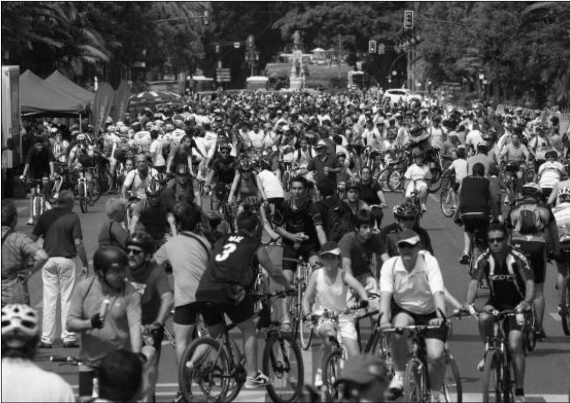
El pasado año se contó con unos ocho mil inscritos en esta actividad.