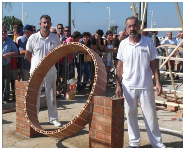
Una vez finalizado el trabajo.

A la finalización del concurso, en el patio central de este centro educativo, se servirá un aperitivo a concursantes, autoridades, colaboradores, invitados y socios de esta entidad perteneciente a la Federación Malagueña de Peñas, Centros Culturales y Casas Regionales 'La Alcazaba'.