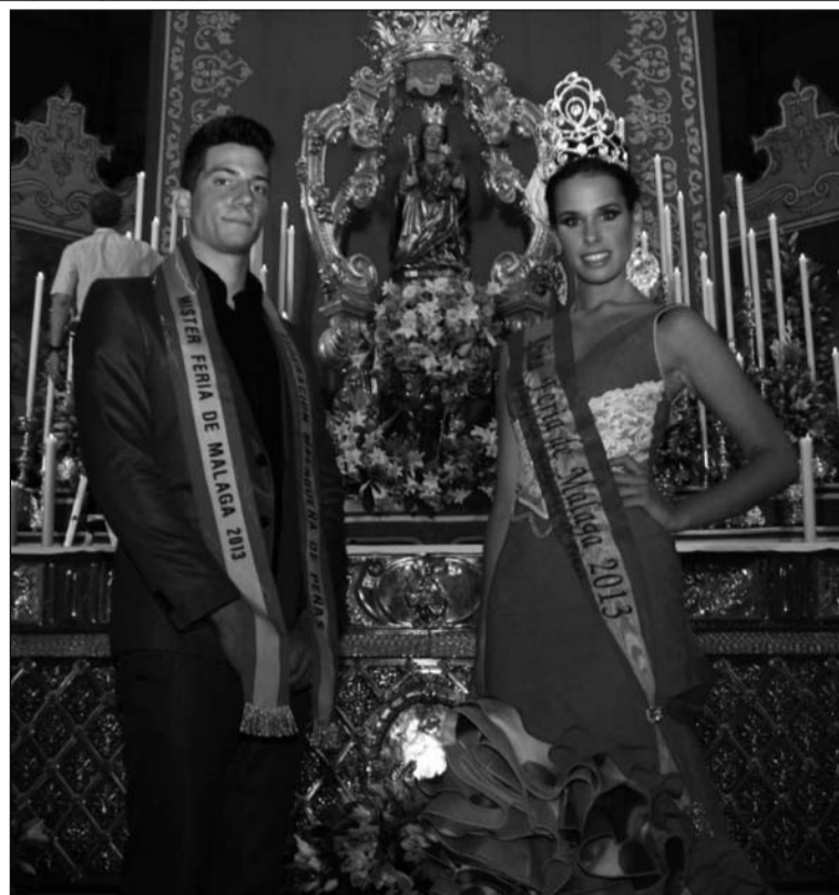
El Mister y la Reina de la Feria de Málaga 2013.

lugar el viernes 6 de septiembre a las 20:00 horas. Como cada año, fueron las Reinas y los Místers de esta recién concluida Feria de Málaga 2013 los que hicieron entrega de estos ramos o canastillas en representación de las entidades por las que fueron elegidos y por la propia Federación.