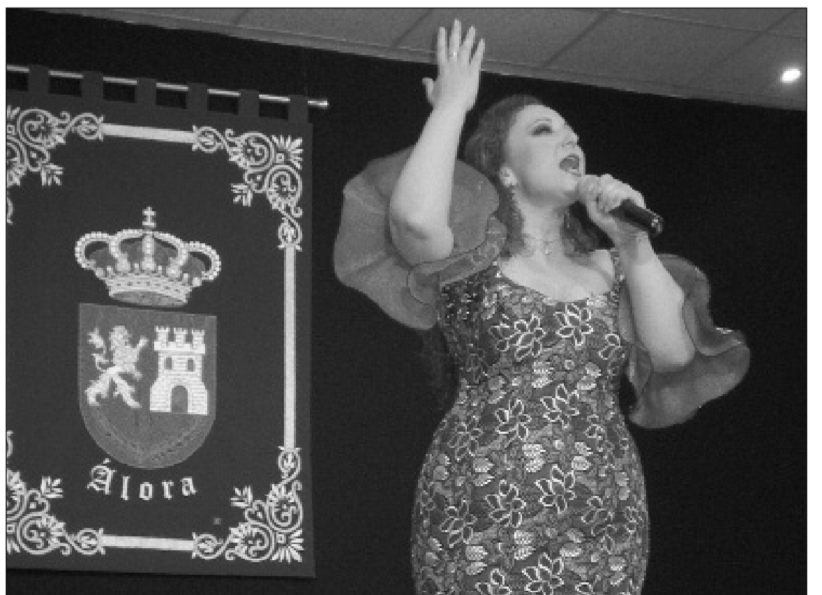
La sede de la Casa de Álora acoge la primera fase.