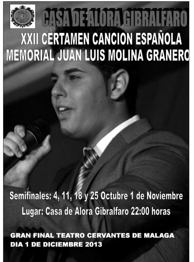
Cartel de esta edición.

Las participantes femeninas deberán actuar con el vestuario propio para interpretar copla, quedando descalificada quien lo haga en traje de noche largo o de calle, a los participantes masculinos no se les admitirá pantalón vaquero.