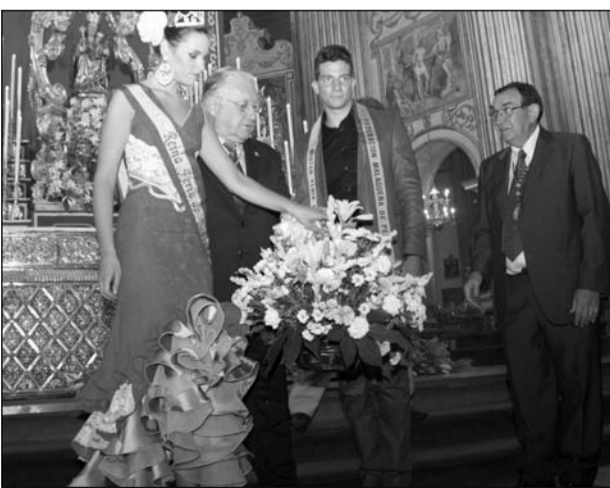
Entrega de flores por parte de la Reina y el Mister de la Feria.