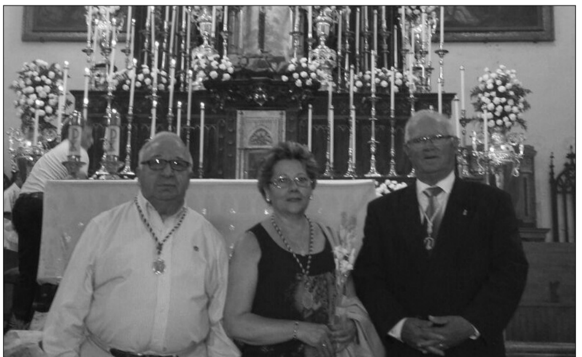
El presidente de la Federación y su esposa, tras recibir las medallas de manos del hermano mayor.

Como un hermano más de esta corporación, el presidente ha portado esta medalla en los restantes actos en los que la Federación de Peñas ha participado hasta el retorno de la Virgen a su Santuario en la noche del domingo 8 de septiembre.