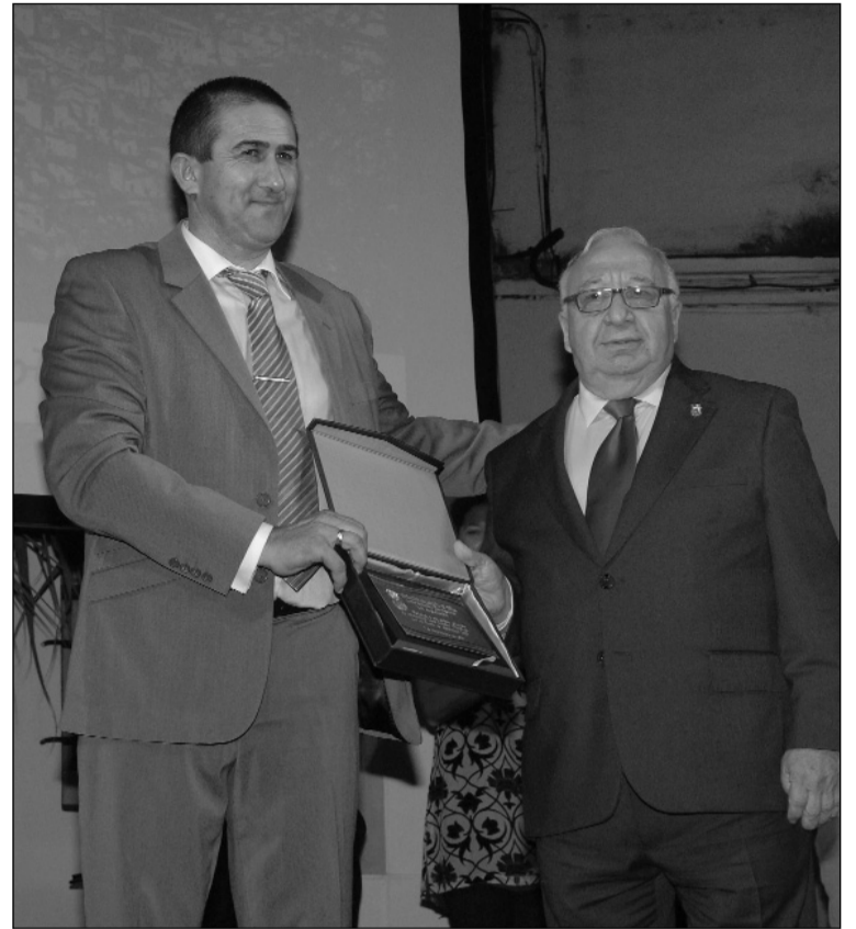
La Federación de Peñas quiso hacer entrega de un recuerdo al regidor.

La Federación Malagueña de Peñas, Centros Culturales y