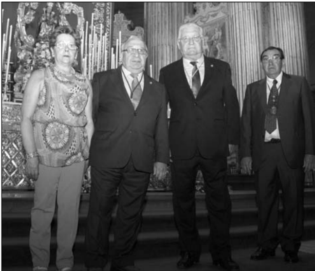
En el centro, el presidente de la Federación y el Hermano Mayor.