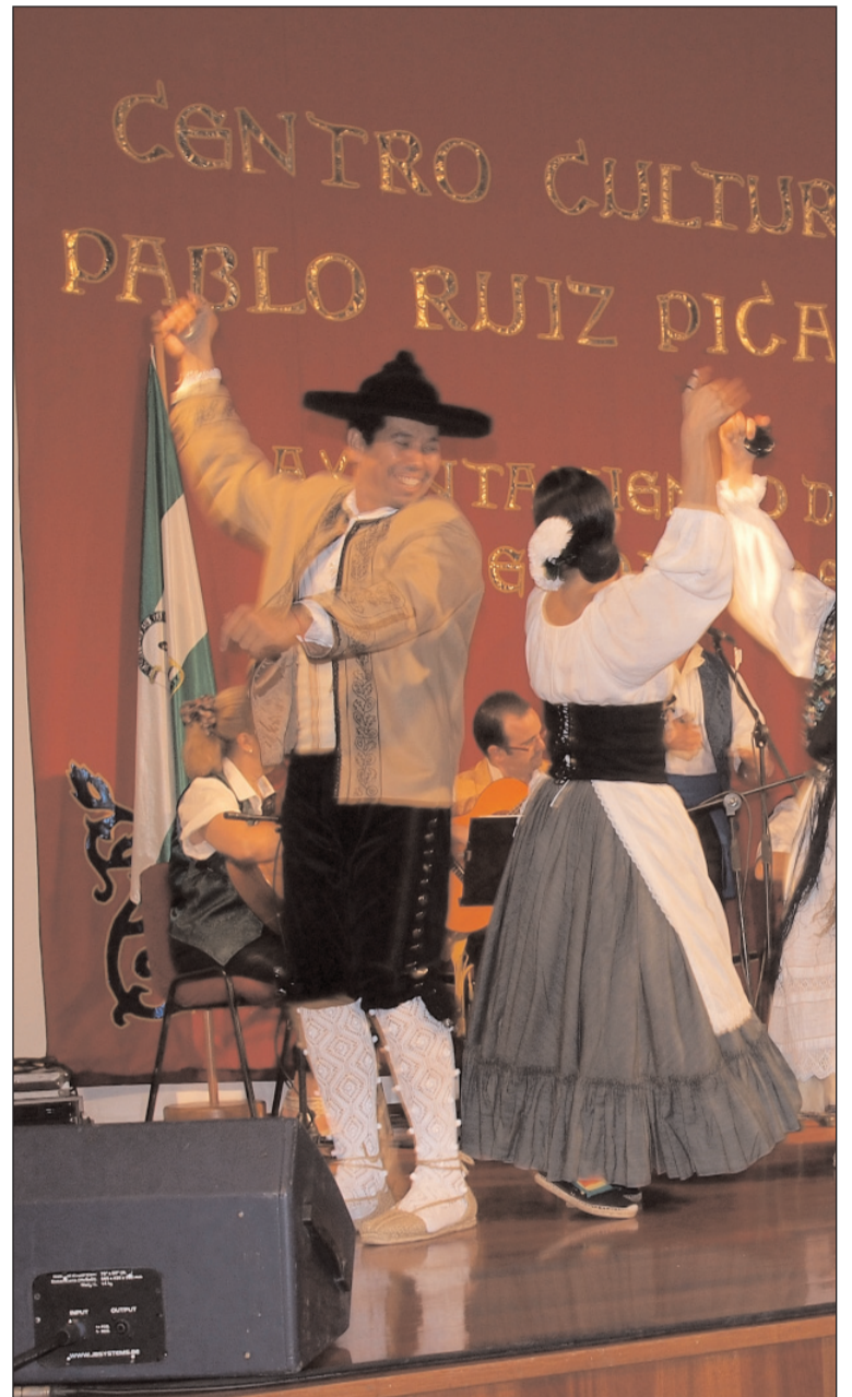
Imagen de archivo de la edición de 2012.

A las 14:30 se servirá una comida de hermandad para socios que será amenizada por la Banda de Gaitas 'Brisas de Asturias', el Agrupación 'L'Alborá', y la Agrupación Músico Vocal 'Cuarentuna'.