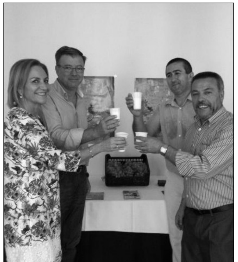
Presentación de la Fiesta del Ajoblanco en nuestra capital.

El broche final a la Fiesta del Ajoblanco, la más antigua de la provincia de estas características, lo ponía una verbena que tenía lugar en la plaza de la Axarquía y en la que se ofreció sangría y tapeo gratis. La fiesta contó, además, con una velada flamenca y las actuaciones de pandas de verdiales, grupos de baile y un coro rociero.