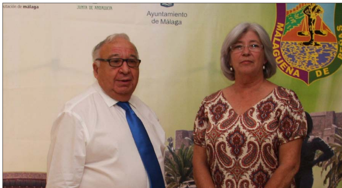
Los presidentes de la Federación de Peñas y la Asociación de Vecinos Centro Antiguo.

Ambos presidentes mostraron su satisfacción por esta reunión, emplazándose a seguir colaborando en próximas actividades en el futuro.