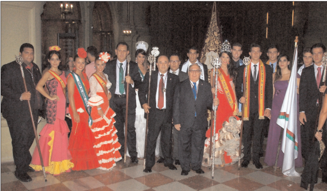
Representación peñista antes de iniciarse la procesión.