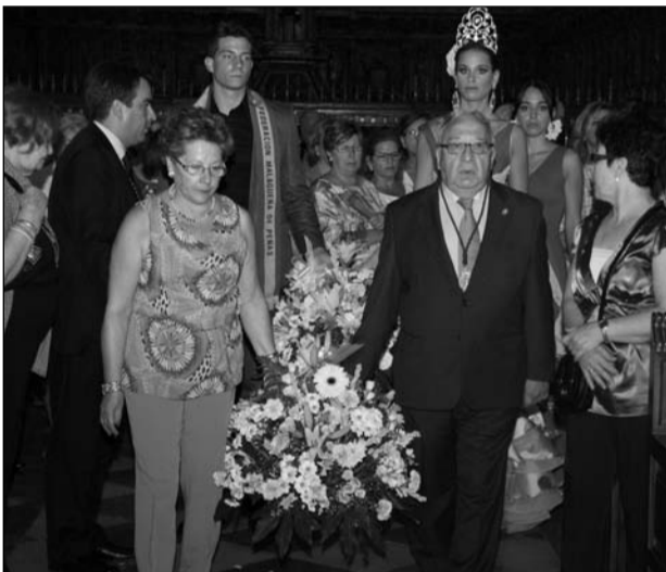
El presidente y su señora realizaron la ofrenda del colectivo.