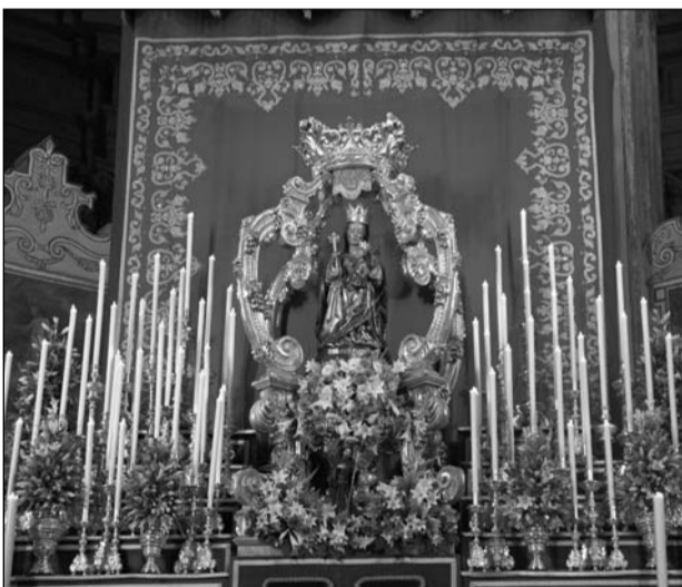
Santa María de la Victoria, en el altar mayor.