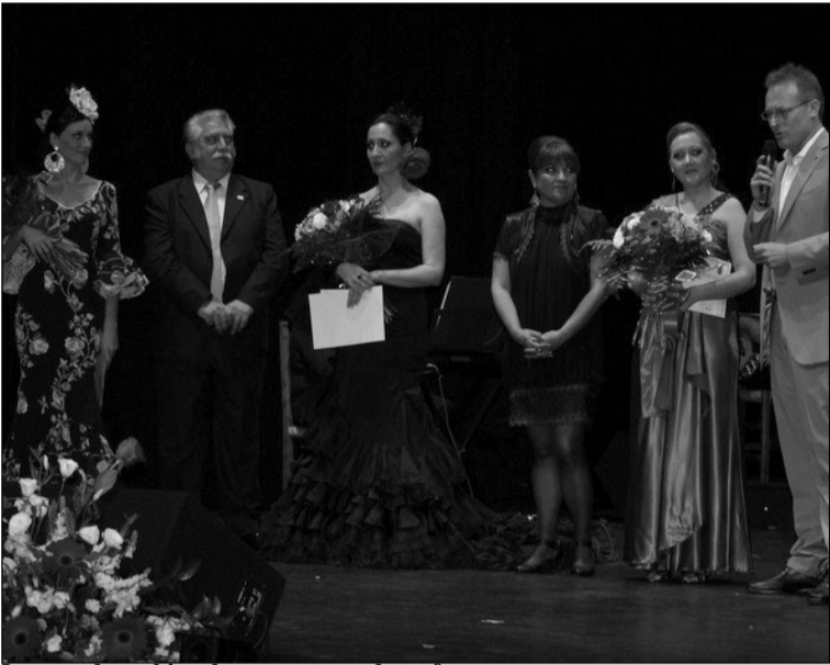
Imagen de archivo de una entrega de trofeos.