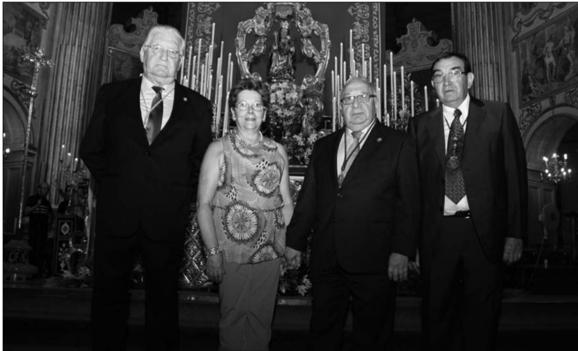
El presidente y su señora, con representantes de la Real Hermandad de Santa María de la Victoria.