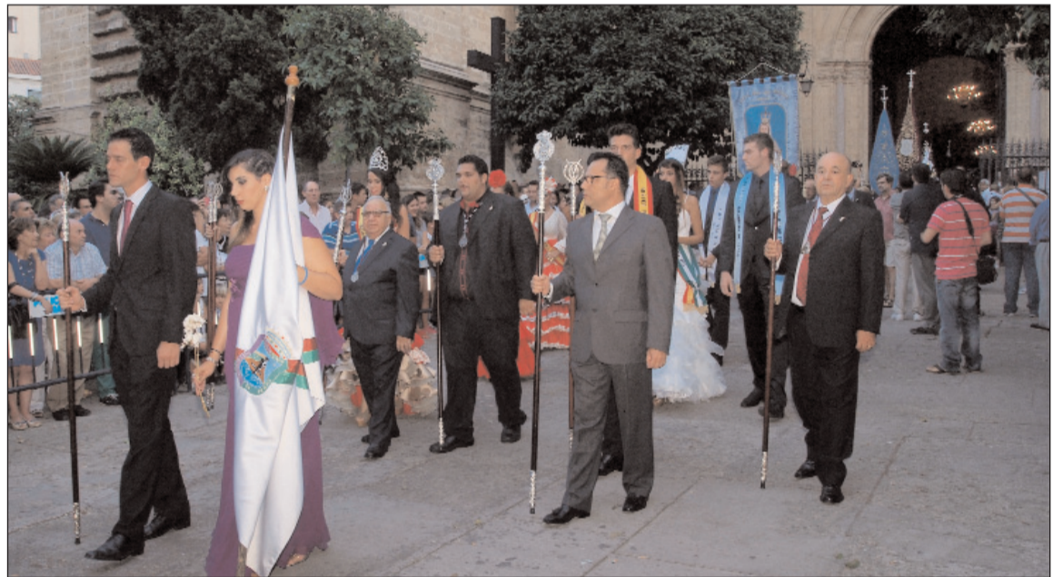
Salida de la procesión del Patio de los Naranjos.