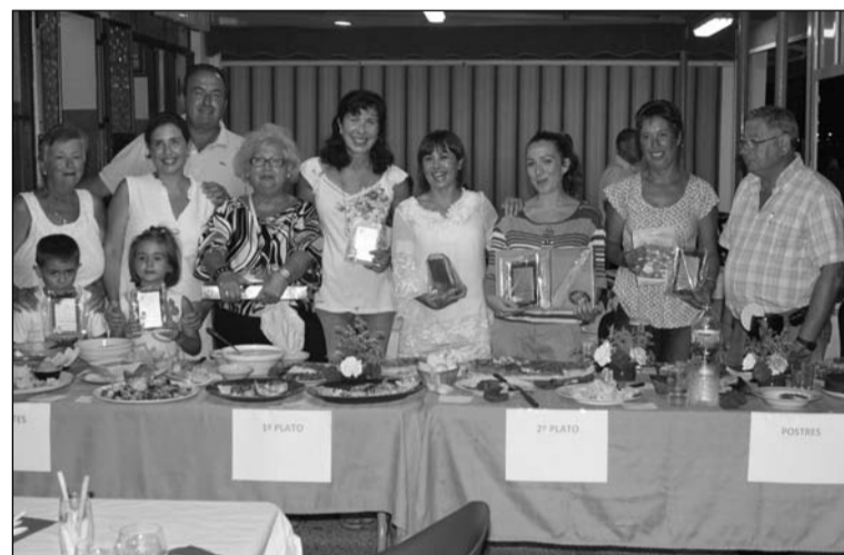
Participantes con sus platos preparados para la ocasión.

Hubo entrega de trofeos y recuerdos para los participantes, así como entre todos los asistentes se dio buena cuenta de todas estas viandas preparadas para la ocasión.