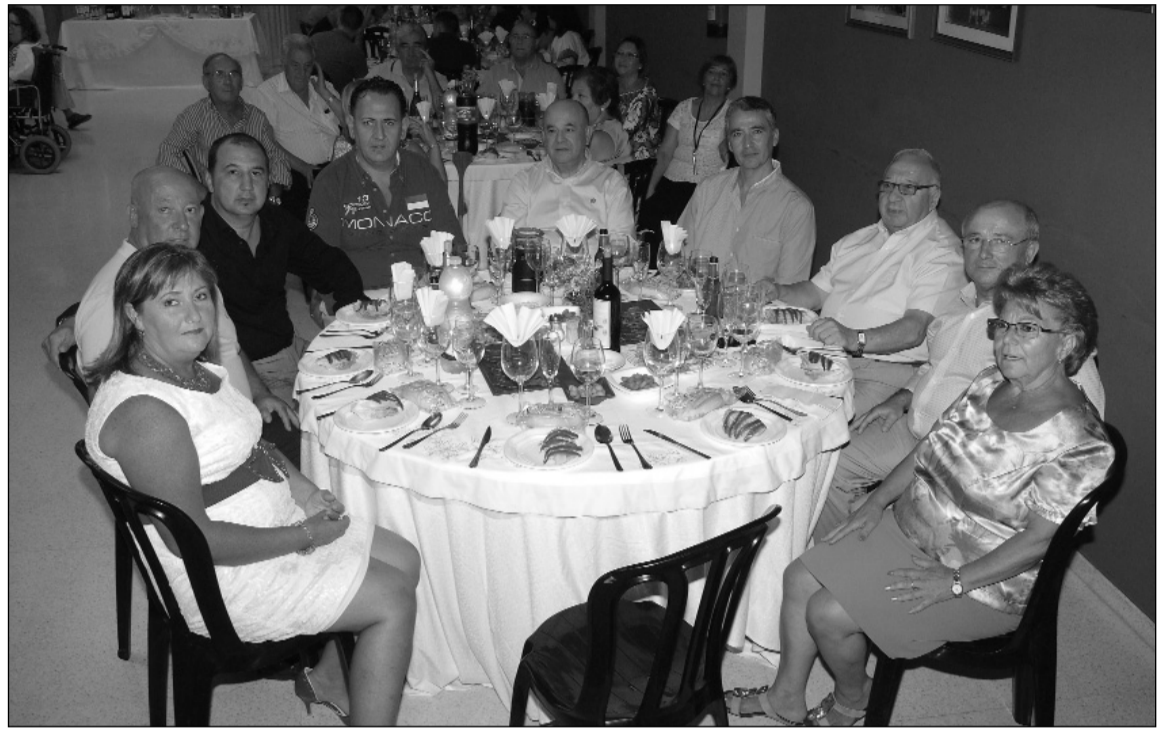
El presidente y directivos de la Peña Santa Cristina, con la representación de la Federación Malagueña de Peñas.