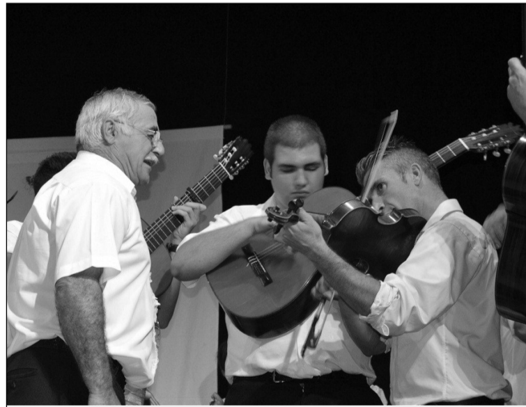
Intervención de la panda de verdiales.