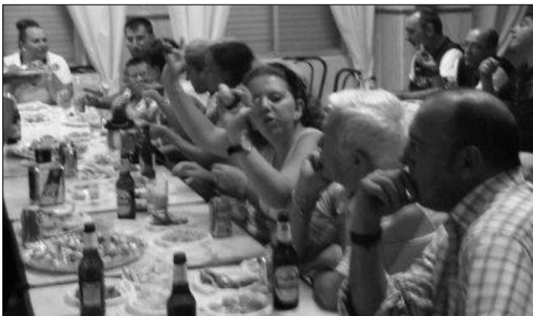
Uno de los partidos que se han presenciado en la sede de San Vicente.

De este modo, y hasta que dispongan de una sede propia, los socios de la Peña San Vicente, gentilmente, están cediéndole sus instalaciones para desarrollar sus primeras actividades a esta nueva entidad, que se muestra muy agradecida con el recibimiento recibido y ya disfruta allí de los partidos por televisión.