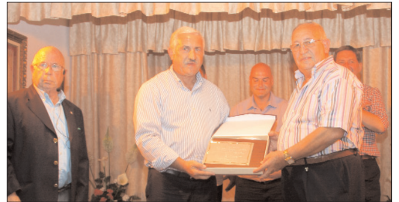
Un instante del recital poético.