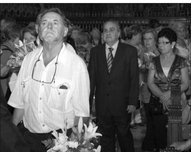
Numerosos presidentes no quisieron faltar a esta ofrenda.