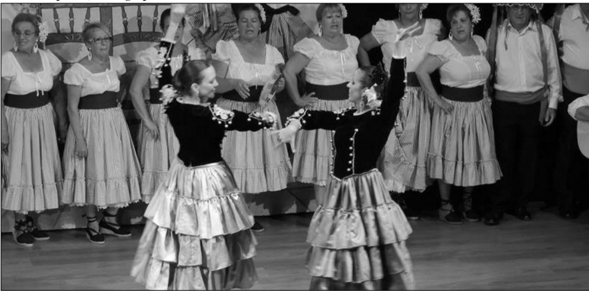
Una de las actuaciones.