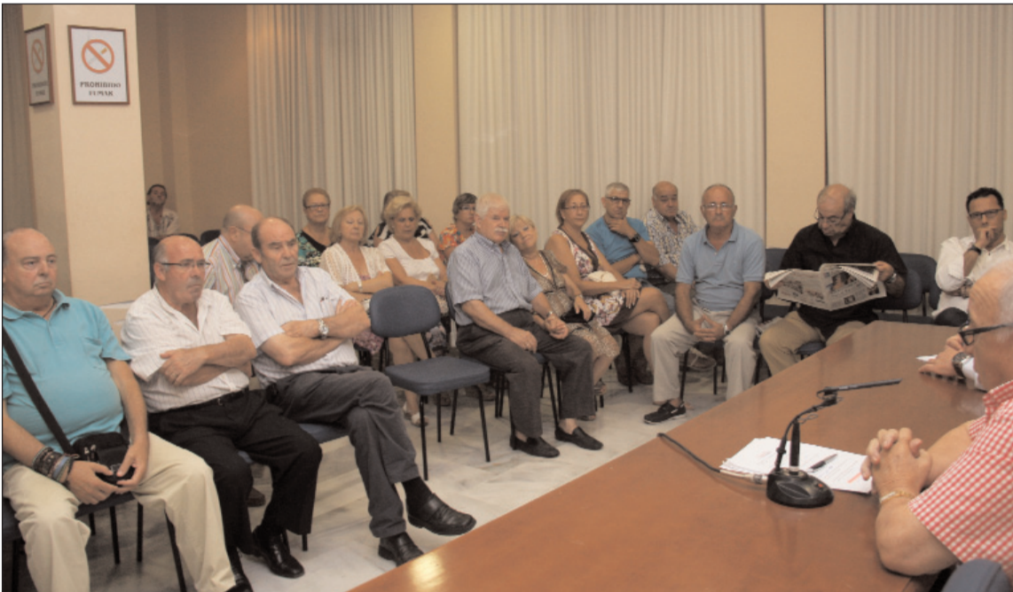
Un instante de la reunión celebrada el pasado lunes 2 de septiembre en la sede de la Federación.