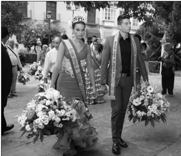
La Reina y el Mister acceden a la catedral con sus flores.