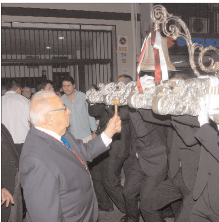
El presidente de la Federación fue invitado a dar unos toques de campana.