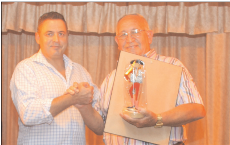
Entrega de recuerdos al homenajeado.