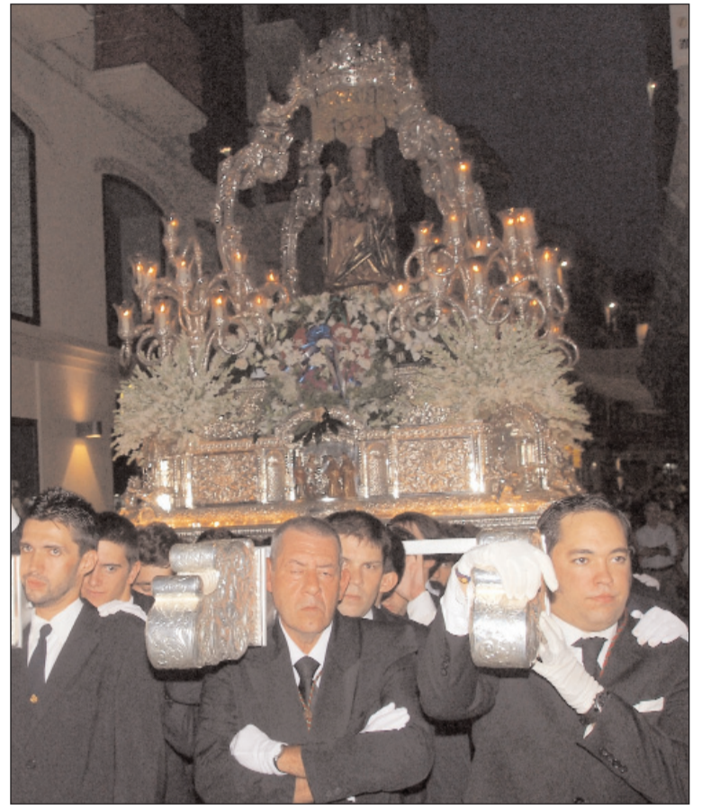
Imagen de Santa María de la Victoria en su trono procesional.

Los frailes fundaron allí la casa Matriz de la Orden Mínima en España y desde aquí comenzaron a expandirse. Por expreso deseo de los Reyes Católicos recibieron el sobrenombre de 'Victorios' y fundaron la gran mayoría de los conventos en honor a la malagueña Virgen de la Victoria; que continua siendo abogada de los Mínimos.