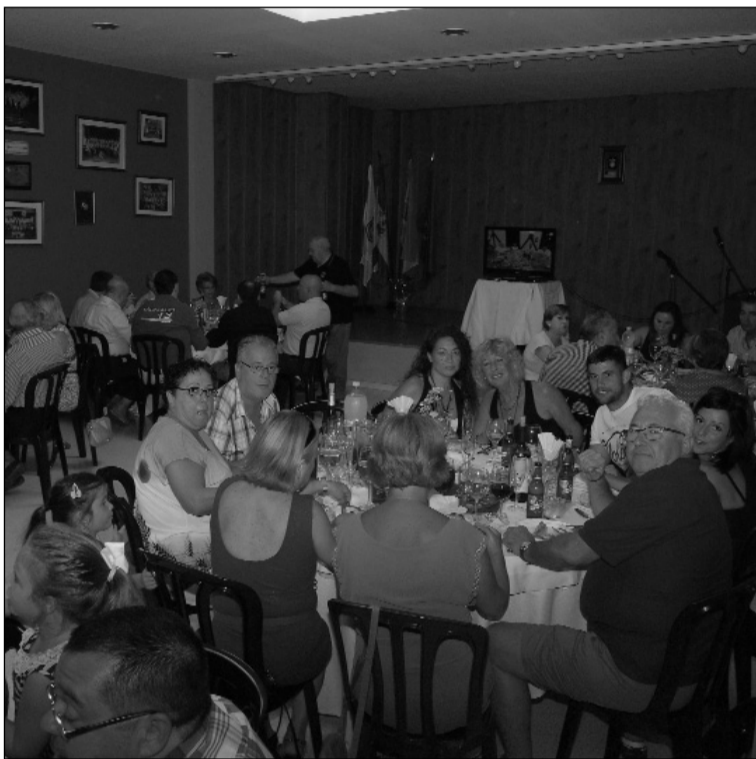
Numerosos socios se dieron cita en la sede.