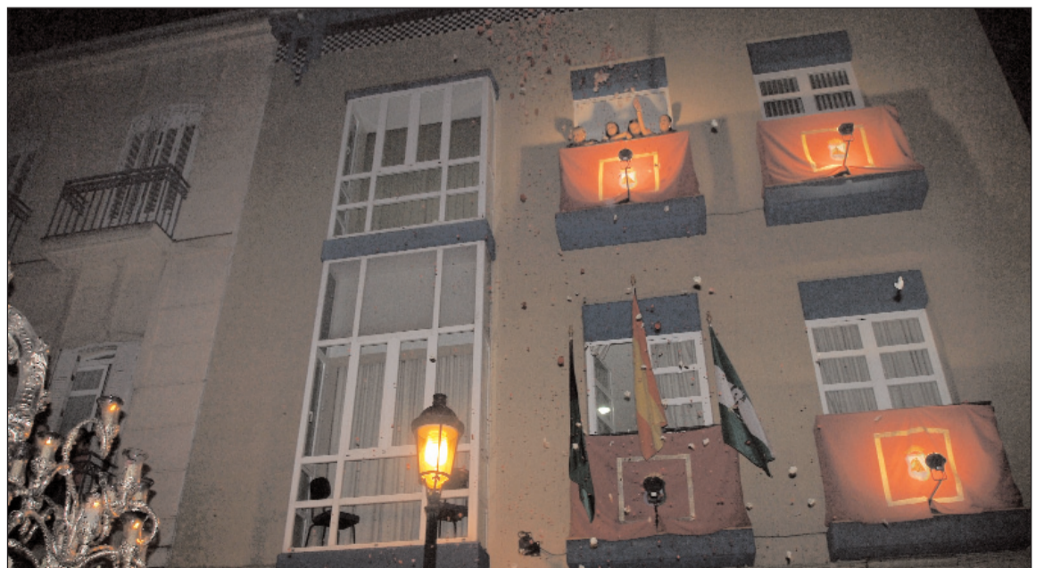
La Federación de Peñas ofreció una petalada a la Patrona de Málaga al paso por su sede.