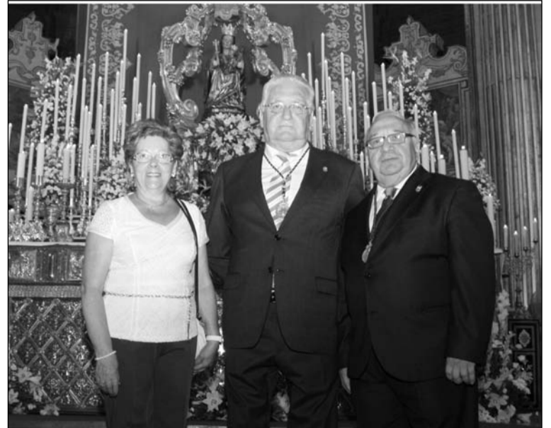
El presidente y su señora, junto al hermano mayor, a los pies de la Victoria.

La Virgen de la Luz fue coronada canónicamente recientemente, concretamente el 16 de junio de este mismo año en un acto celebrado en el Paseo de la Alameda de Tarifa, y presidido por el Obispo Diocesano de Cádiz y Ceuta.