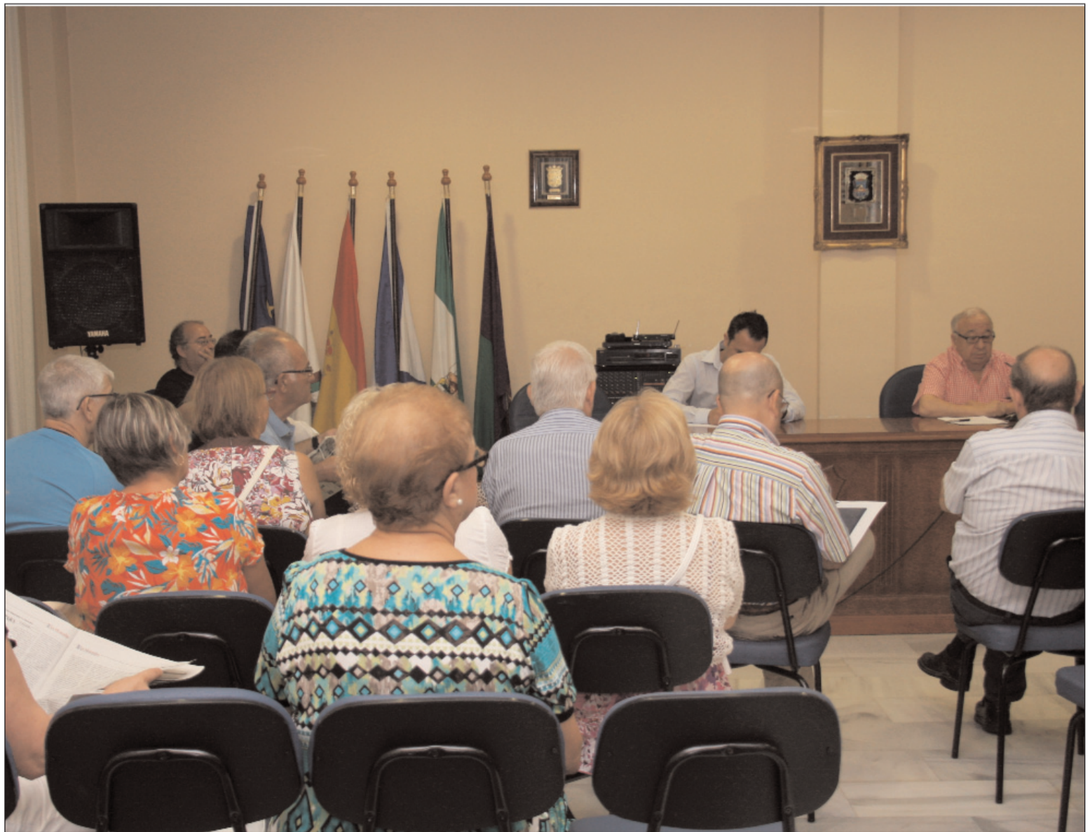
Numerosos presidentes y representantes de las entidades con caseta se dieron cita en la reunión.