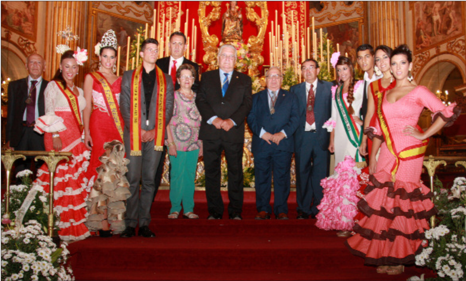
Representantes del colectivo peñista, con miembros de la Real Hermandad, ante Santa María de la Victoria.

Número 532 13 de Septiembre de 2013 C/ Pedro Molina, 1 Tfno: 952 22 54 39 Fax: 952 21 48 82 E-mail: prensa@femape.com - la_alcazaba@hotmail.com Web: www.femape.com Edición digital: www.femape.com/laalcazabadigital Twitter: @FMPLAAlcazaba Búsquenos también en Facebook