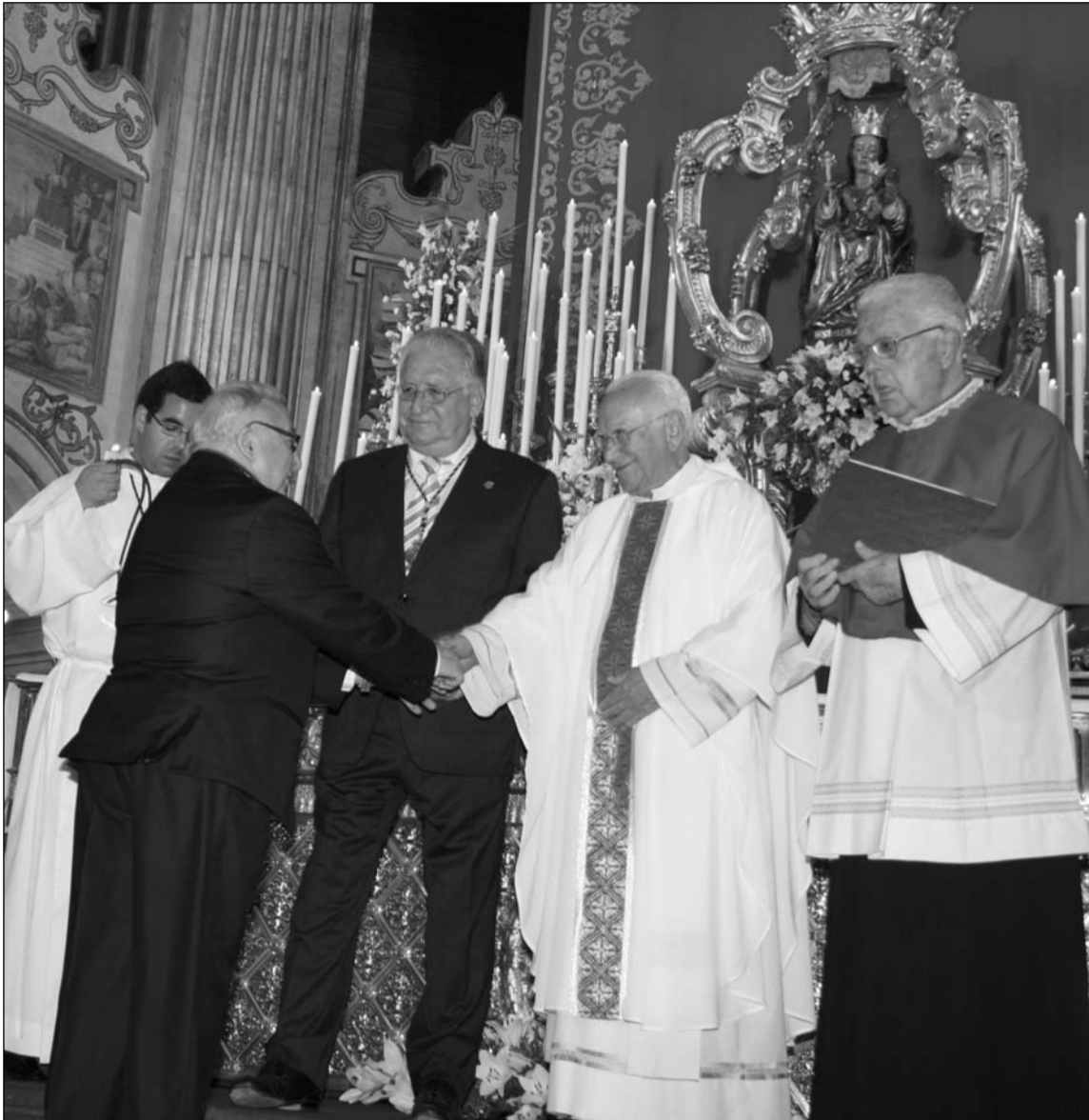
Instante de la imposición al presidente Miguel Carmona.