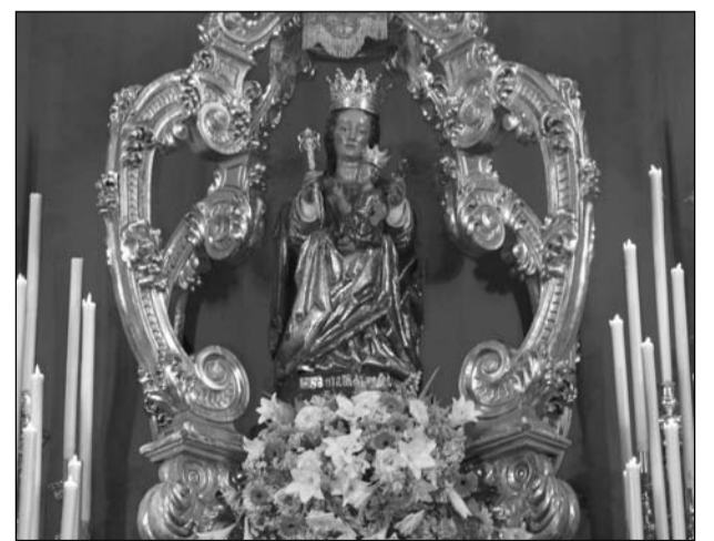
Detalle de la Patrona de Málaga.