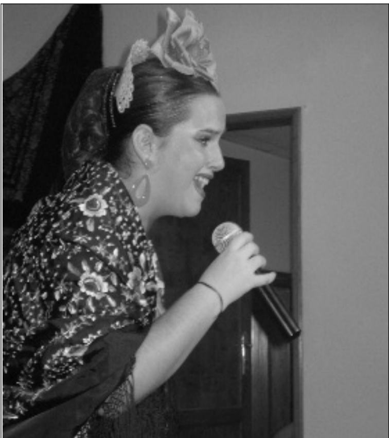
Imagen de archivo de una edición anterior.

En lo que se refiere a premios, el ganador obtendrá 2.000 euros y la grabación de un disco single de dos temas inéditos por gentileza de Tony Carmona; mientras que los restantes finalizas obtendrán 400 euros y una maqueta.