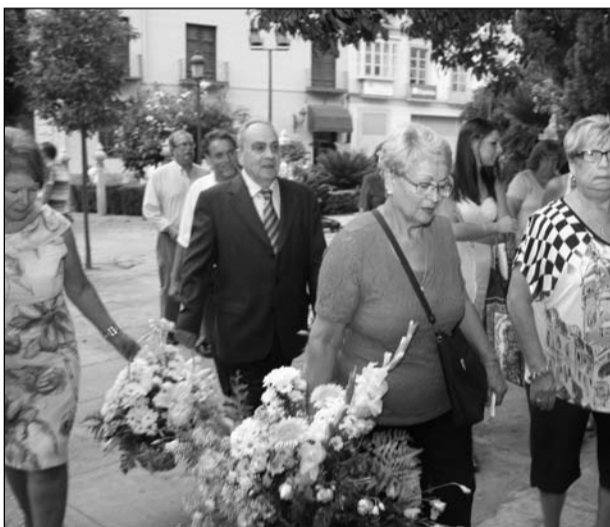
Peñas con sus canastillas entrando a la catedral.