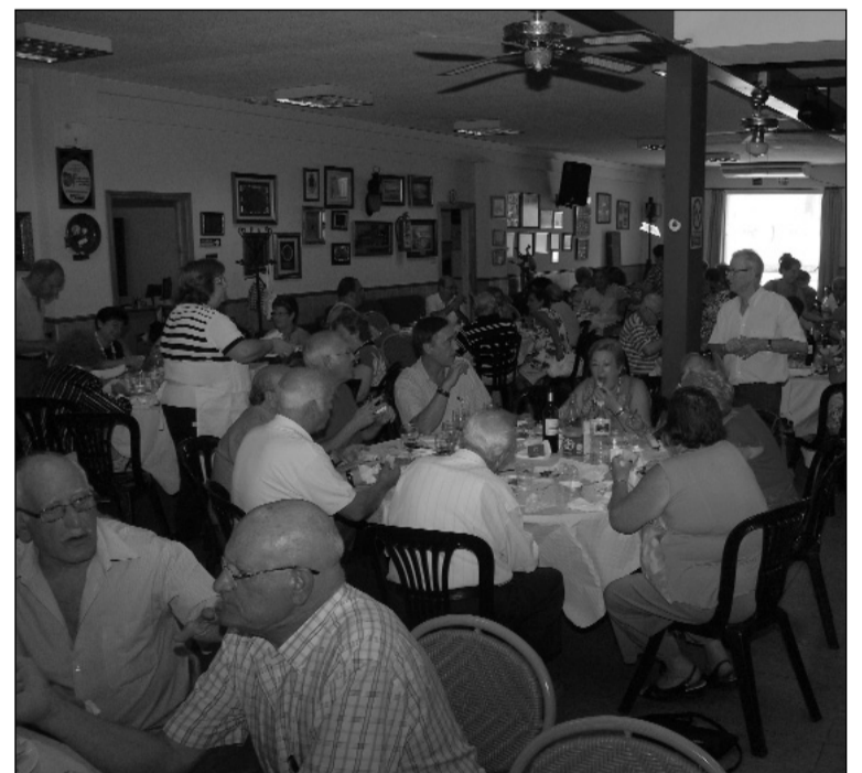
Vista del salón durante la comida de hermandad.