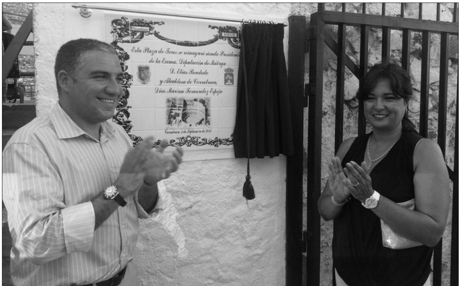
El presidente de la Diputación y la alcaldesa, tras descubrir un azulejo conmemorativo.

Además, será escenario de algunos espectáculos no taurinos como 'Carratraca Embrujo Andalusi' y la representación de la Pasión de Cristo en Semana Santa, entre otros eventos.