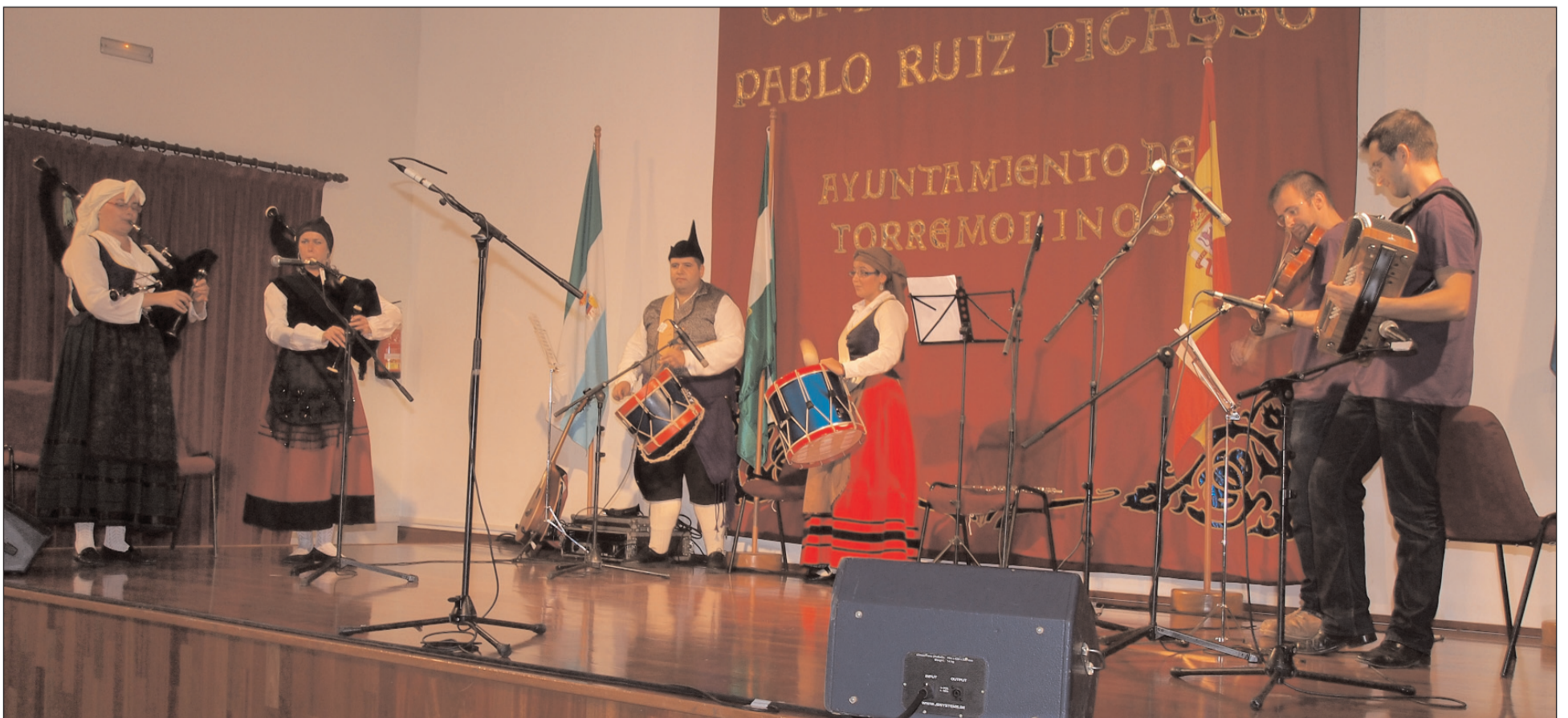
Actuación en el Día de Asturias 2012.