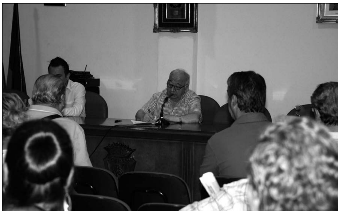
El presidente, en el centro, toma nota de las opiniones de los peñistas en la reunión del pasado 2 de septiembre.