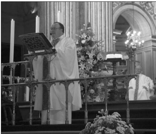
Un momento de la celebración religiosa.