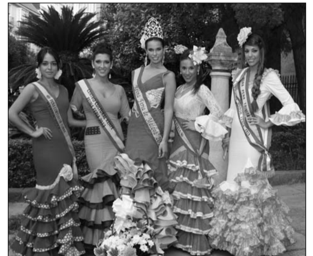
Algunas de las reinas que acudieron a esta ofrenda.