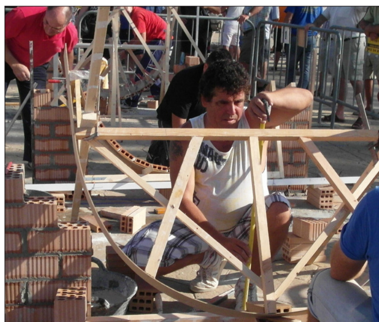
Un instante del concurso del pasado año.