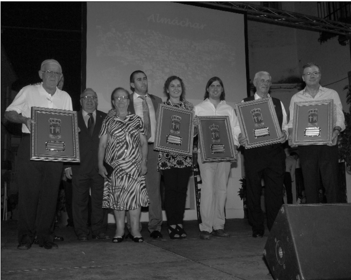
El presidente de la Federación de Peñas y el alcalde, con los premiados de la Fiesta del Ajoblanco.