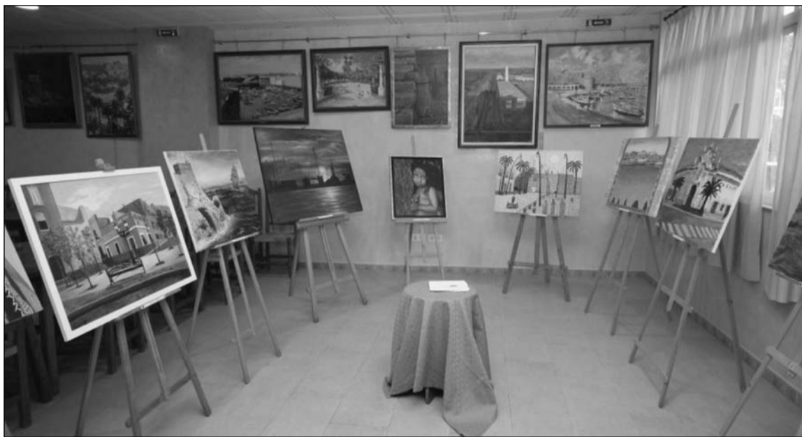
Exposición de la anterior edición del Certamen.