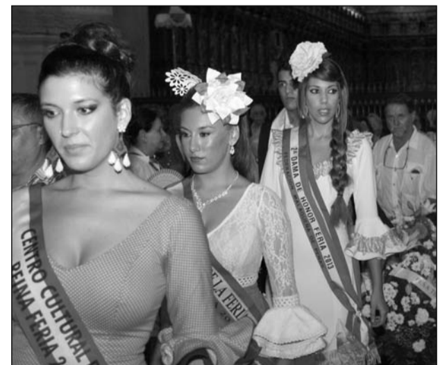
Las Reinas acudieron ataviadas con trajes flamencos.