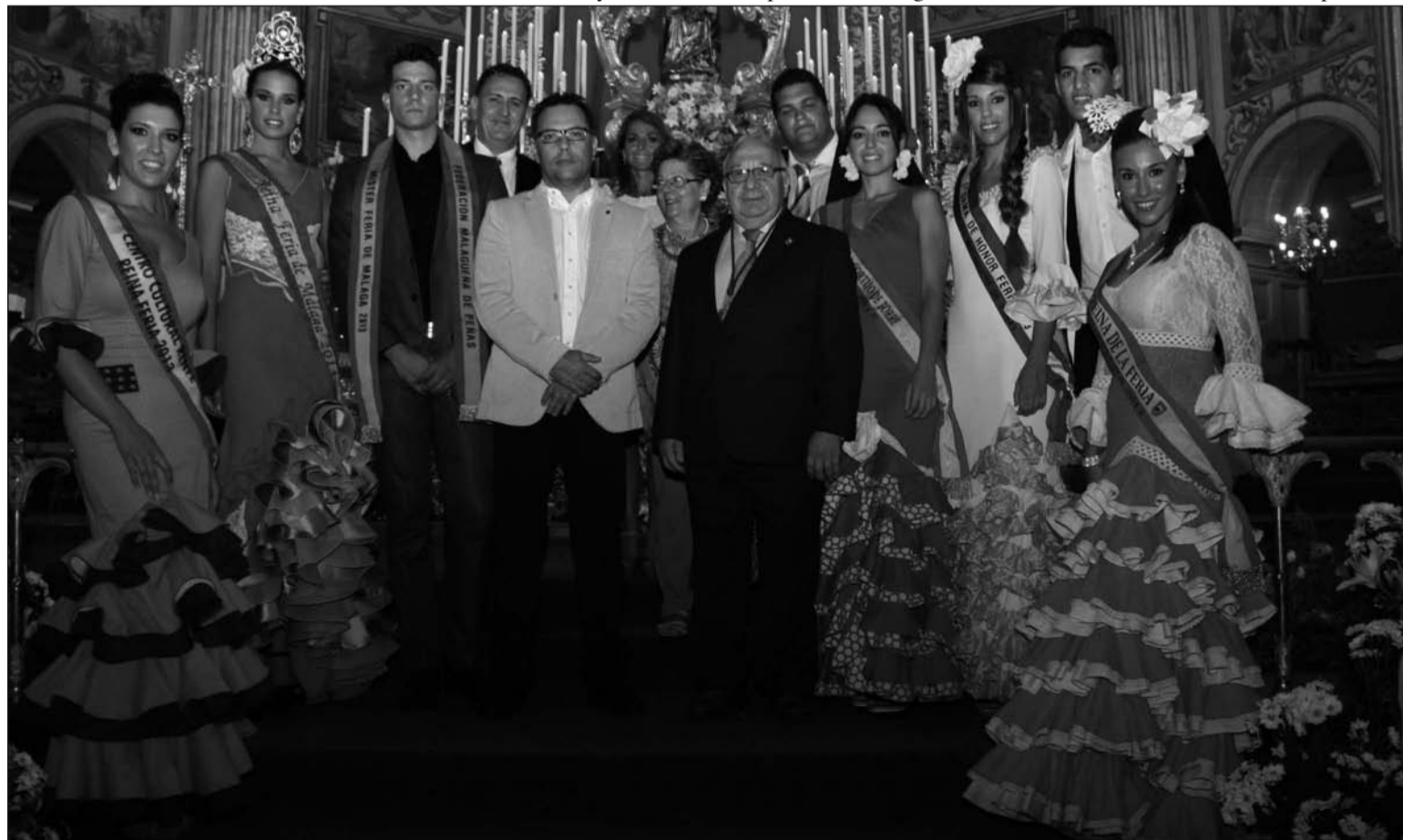
Representación del colectivo peñista en la Catedral.

La cita de septiembre siempre es en la Santa Iglesia Catedral, cuyo altar mayor presidía Santa María de la Victoria. De este modo, la Ofrenda Floral de los peñistas malagueños tenía