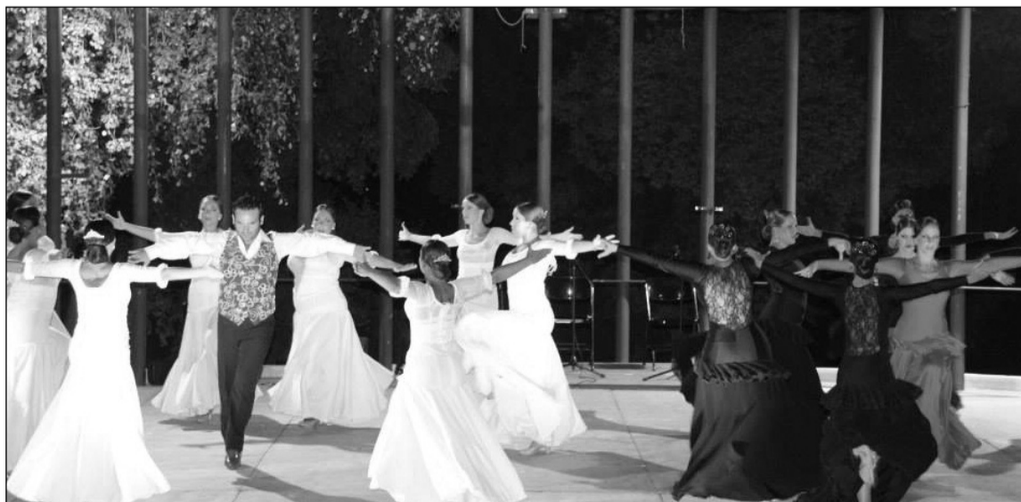
Un momento del espectáculo.

Esta actuación fue la última antes de partir a la mañana siguiente rumbo a la provincia de Segovia, donde el grupo de baile de esta entidad federada era invitado a participar en un festival celebrado a lo largo del pasado fin de semana.