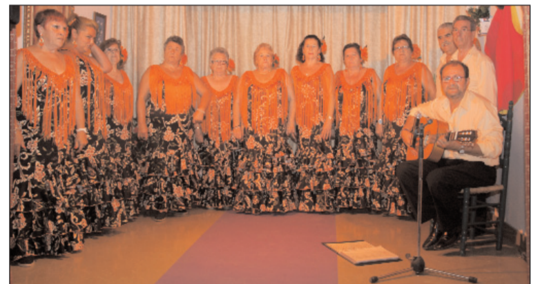
Actuación del coro de la entidad.