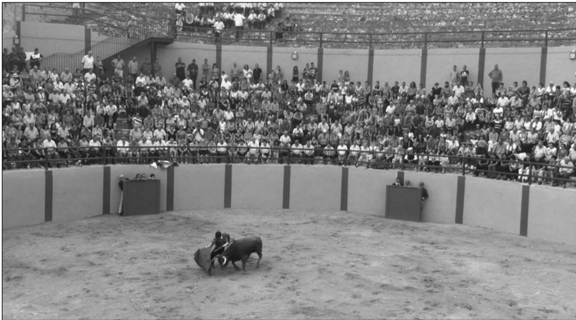
Clase de toro de salón para inaugurar el coso.