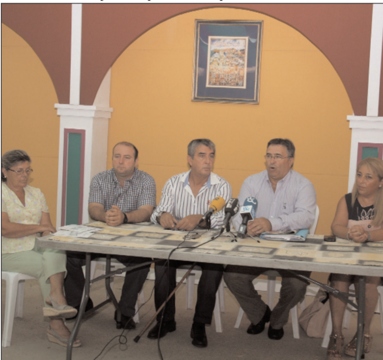
Rueda de prensa ofrecida en la caseta de la Federación.

Estas posturas fueron ratificados por representantes de dos de las casetas más emblemáticas del Real, las de El Portón y La Rebotica, que presentaron sus amplias programaciones para los próximos días.