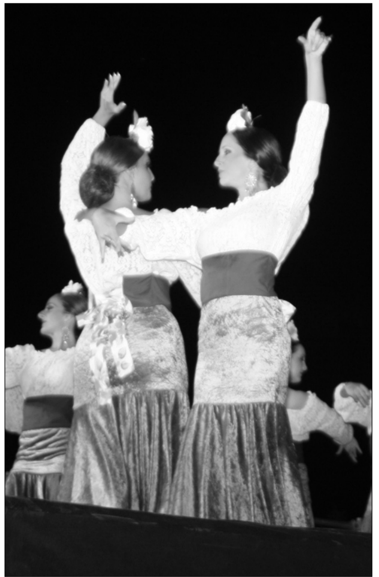
Baile por Malagueñas.