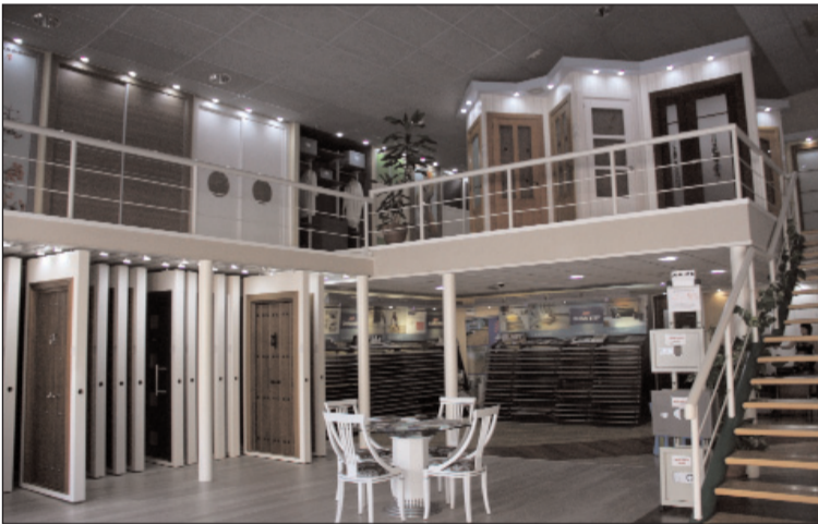
Instalaciones de Tesesa en el Polígono El Viso.

Desde Tesesa se apuesta por las tecnologías más vanguardistas para crear nuestras puertas y darles la mejor calidad, todo esto sin olvidar de cuidar con mimo y tradición cada detalle.