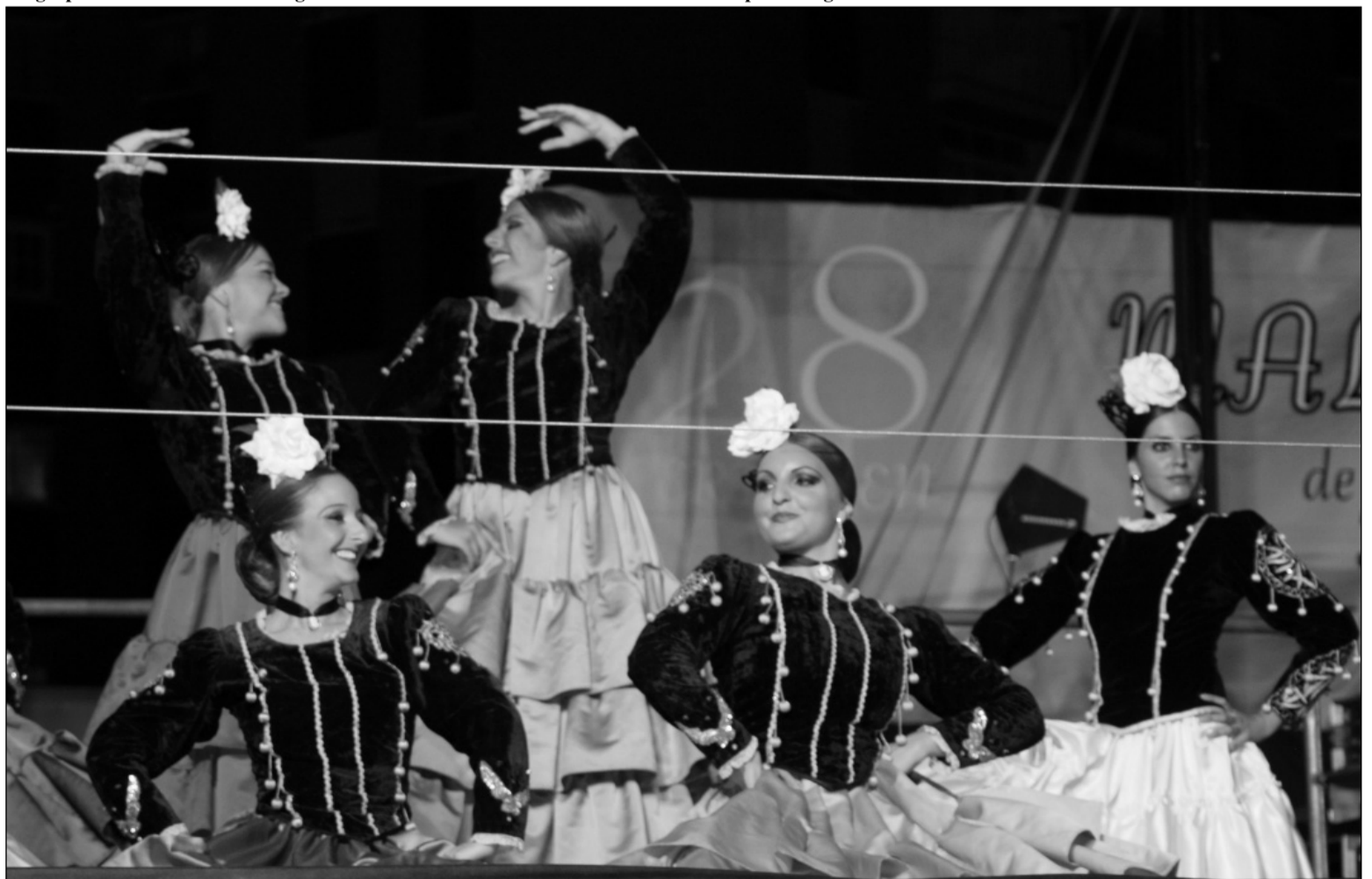
Las Malagueñas de Fiesta volverán a ser bailadas en Cortijo de Torres.