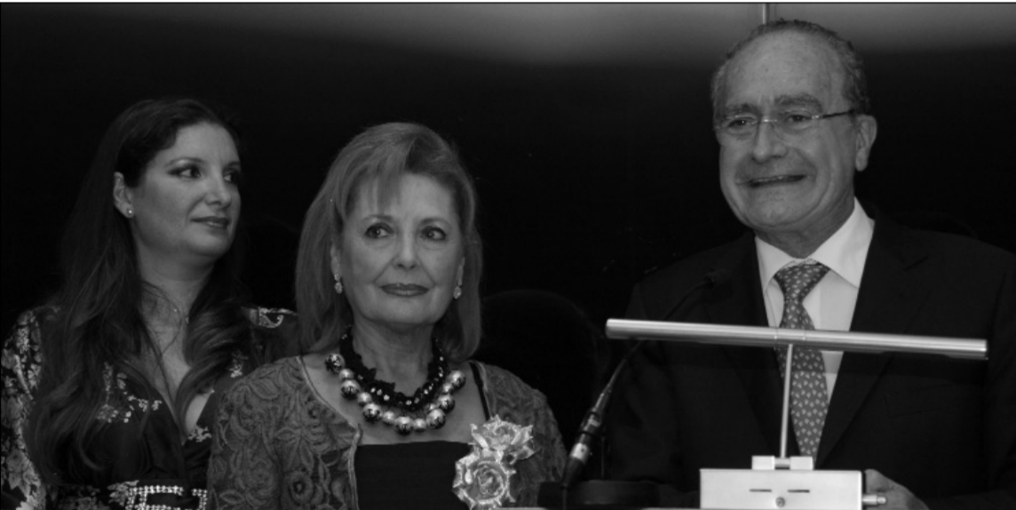
La presidenta de la Peña La Paz, junto al alcalde de Málaga.