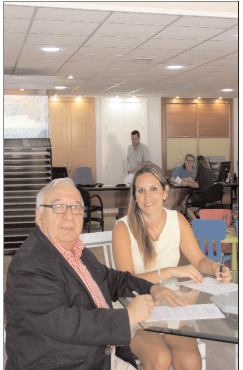
Instante de la firma del convenio.