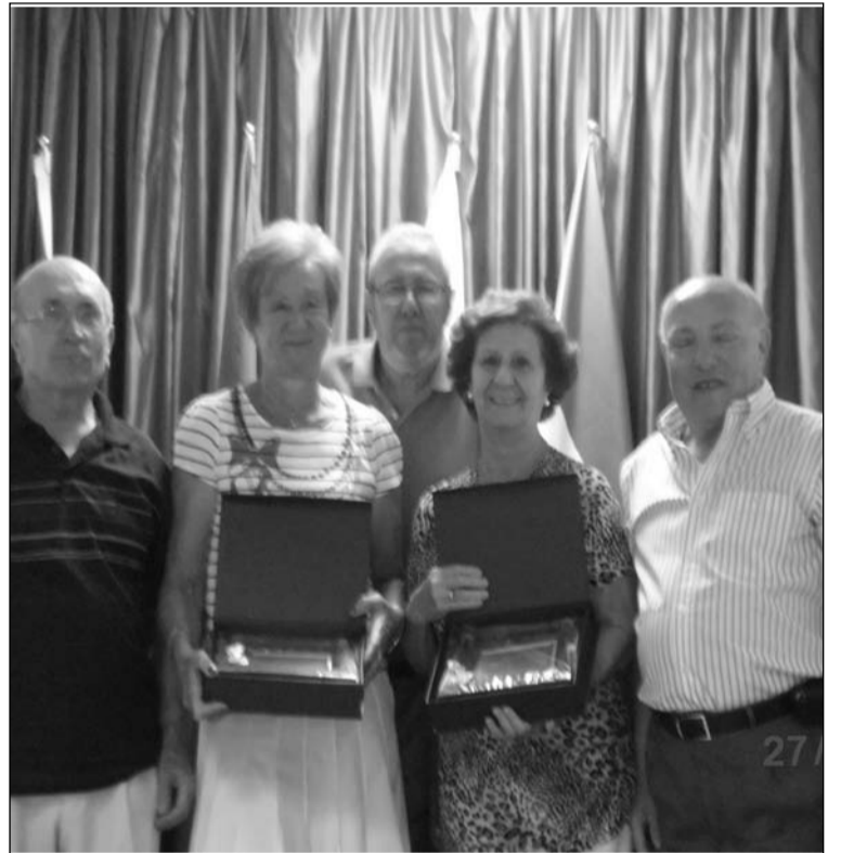
Recuerdo a las dos parejas homenajeadas.

Por otra parte, la Peña El Seis Doble, pese a no contar con caseta en Cortijo de Torres, sí que celebrará la Feria en la jornada del viernes 23 de agosto en la caseta de una entidad hermana como es la Peña Los ángeles. Allí se procederá a la elección de Reina y Mister Infantil, a la vez que se contará con la actuación de su Coro Jazmines Mala-