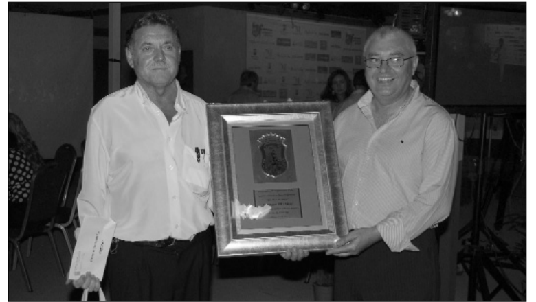
Entrega del premio de la edición anterior.

noche cientos de estos frutos tan veraniegos a los malagueños y turistas que pasan por su caseta, en lo que se ha convertido en su principal seña de identidad gastronómica en la Feria de Málaga.