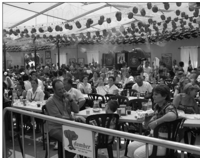
El certamen acapara la atención de muchos malagueños y visitantes.

En la pasada edición de 'San Miguel y Málaga Solidarios', se recaudó un total de 12.000 euros que fueron destinados íntegramente