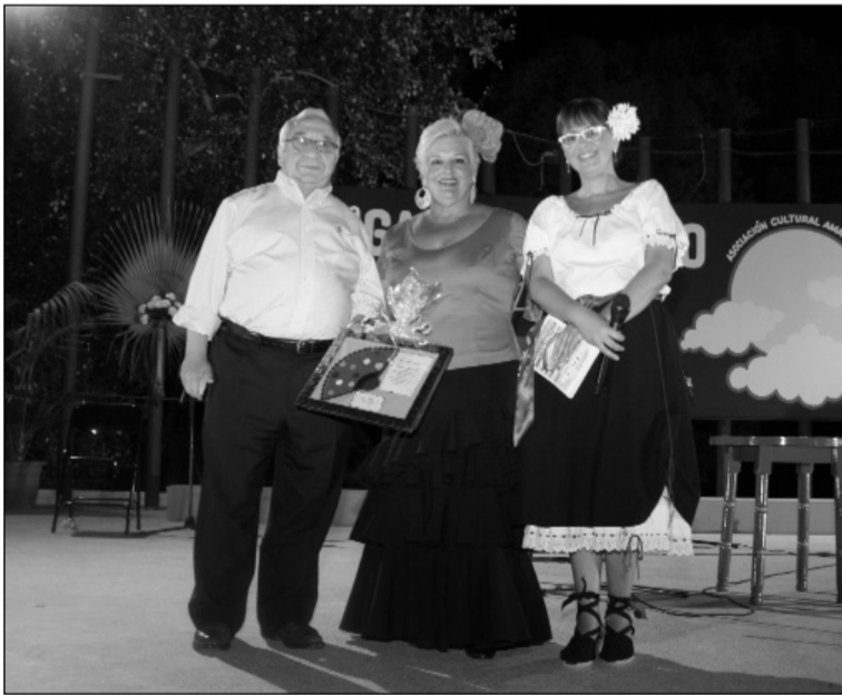
El presidente de la Federación, con la presidenta de Amanecer y la presentadora.