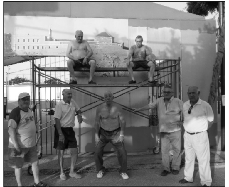
Socios preparando la fachada de una de las casetas.

En su décimo sexta edición, el primer premio será de 500 euros y una placa cerámica para añadir a la decoración de la caseta. Igualmente, los segundos clasificados obtendrán 300 euros y placa cerámica; mientras que los terceros a juicio de jurado seleccionado para la ocasión serán de 200 euros y placa cerámica.