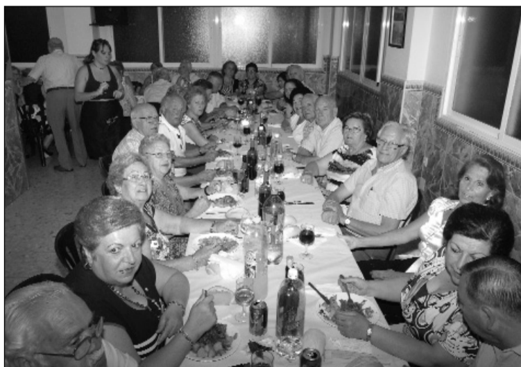
Aspecto de la cena de matrimonios.

tenía lugar una cena en la sede; mientras que el domingo día 28 de julio se procedía a la celebración de una fiesta en los salones de la peña en la que se contaba con aperitivos, cerveza y sangría gratis. Estuvieron invitados todos los socios de la entidad perteneciente a la Federación Malagueña de Peñas, Centros Culturales y Casas Regionales La Alcazaba.