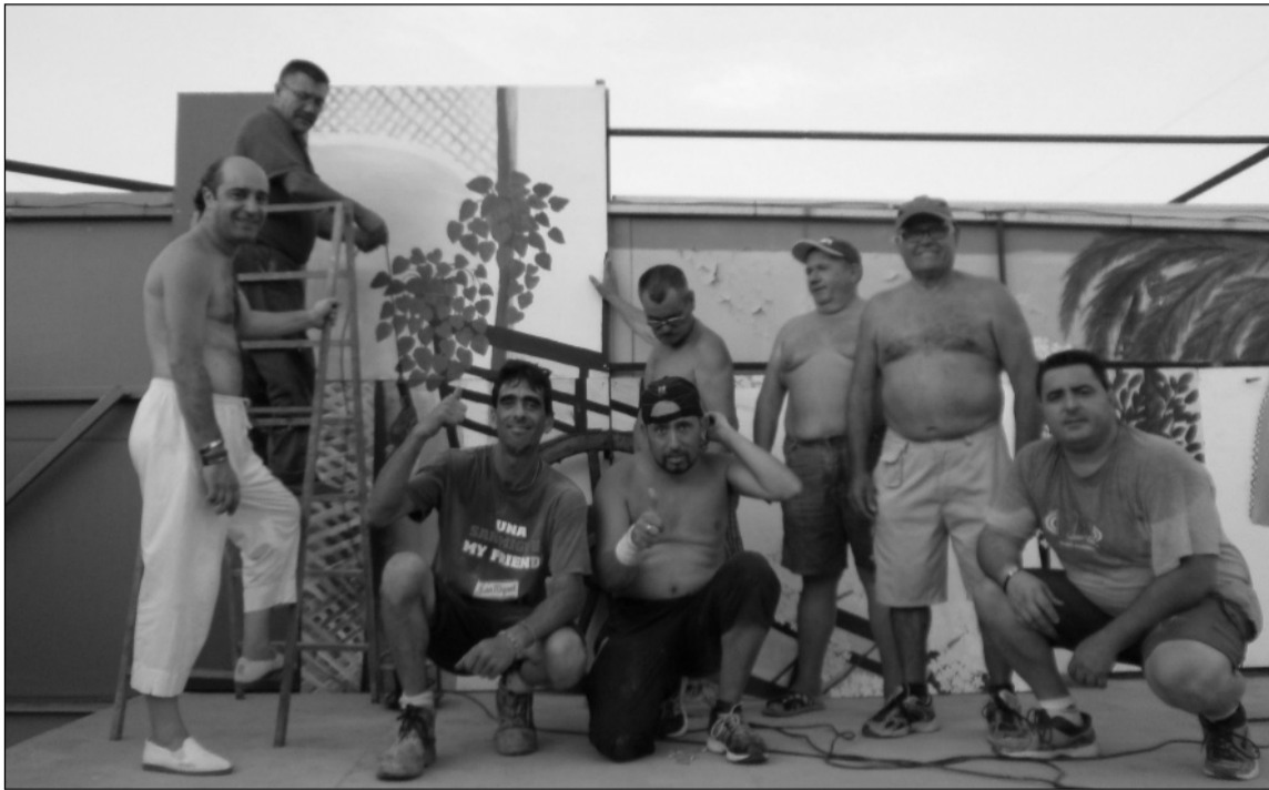
Peñistas trabajando en la preferia.