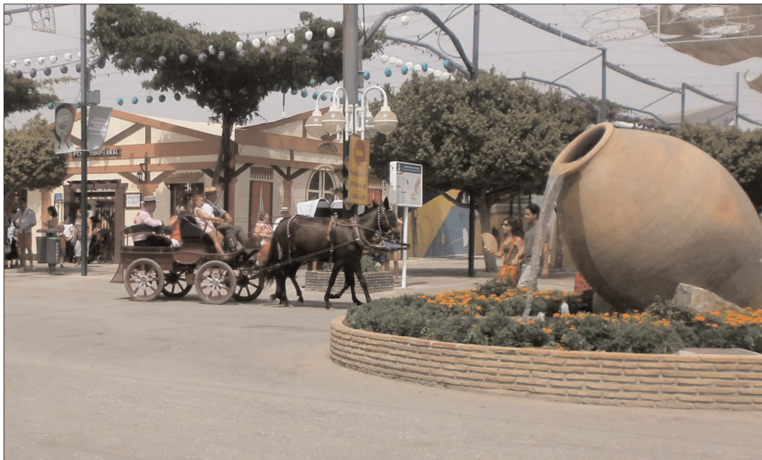
Aspecto del recinto ferial de Cortijo de Torres en una edición anterior de la Feria de Málaga.

Edición digital: www.femape.com/laalcazabadigital Twitter: @FMPLaAlcazaba Búsquenos también en Facebook