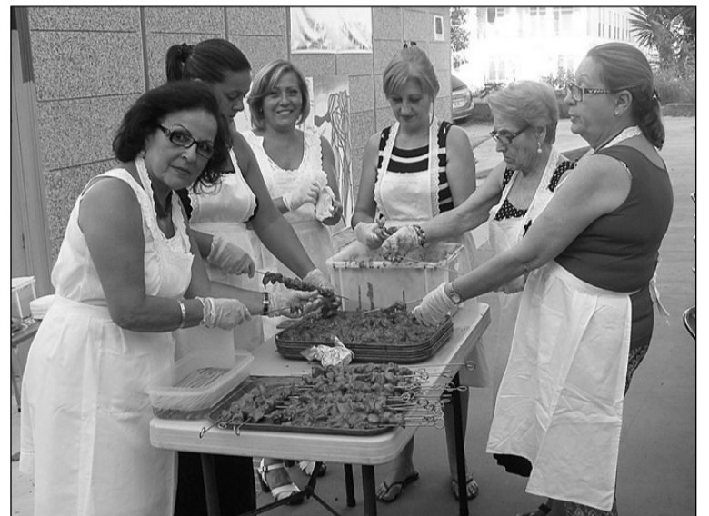
Socias preparando los pinchitos.