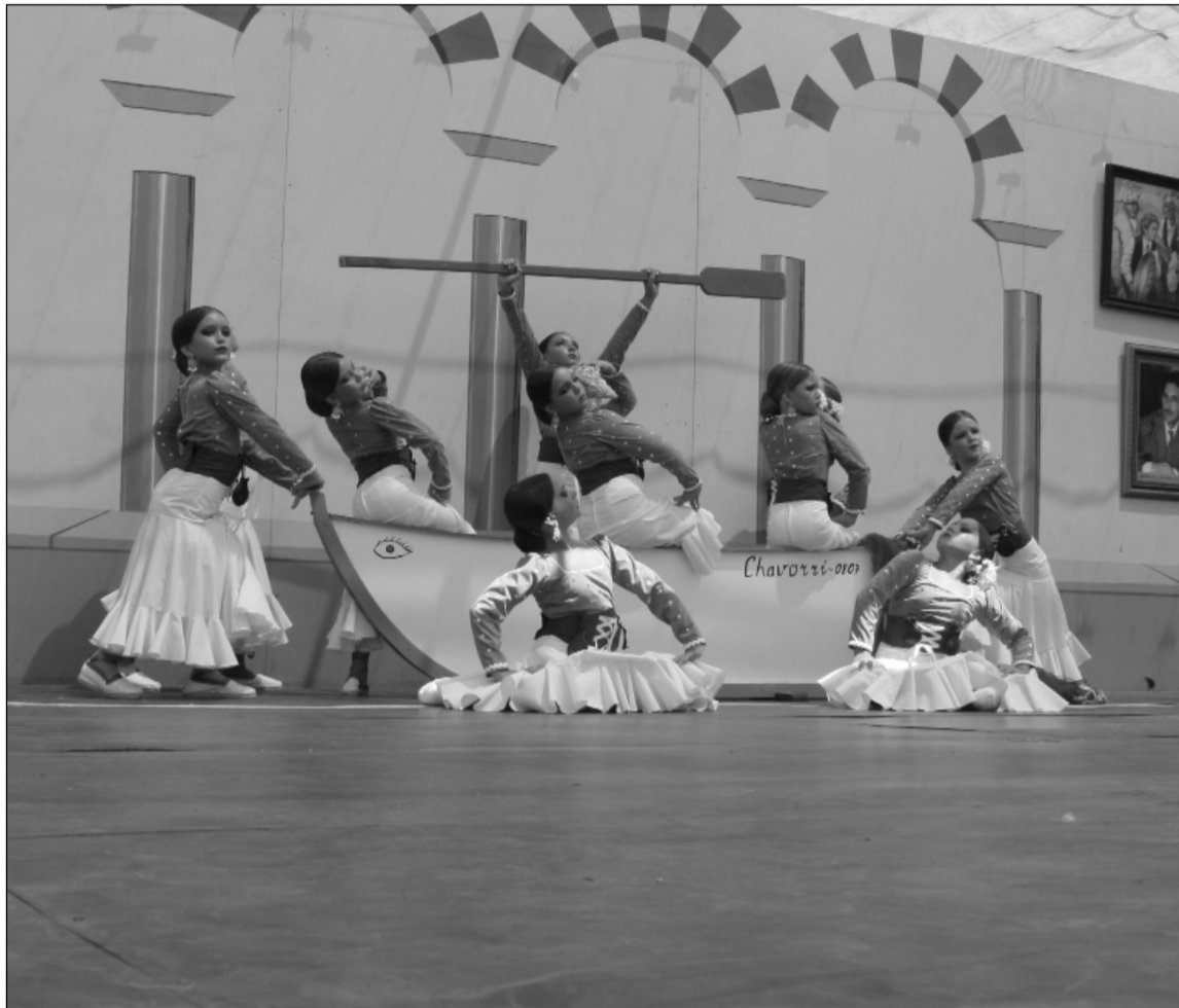
Imagen de archivo de una edición anterior de este certamen.