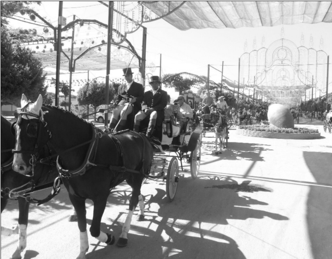
Esta programación musical se unirá al atractivo del paseo de caballos en las mañanas de Feria