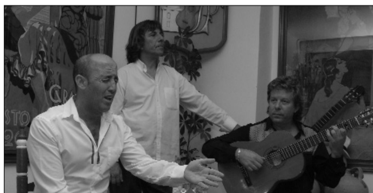
Un instante del espectáculo.