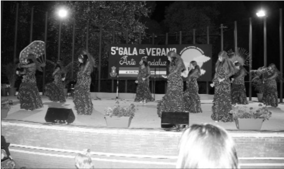
Una de las actuaciones.