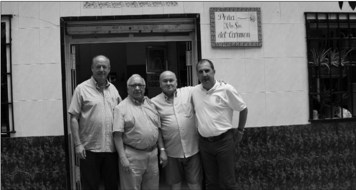
Representantes de la entidad y de la Federación, a la entrada de la sede.