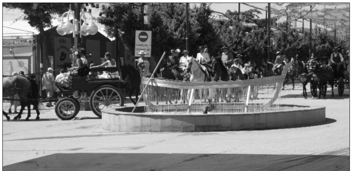
El escenario junto a la Federación se situará en las proximidades de esta plaza.