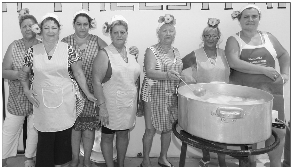
Socias de una peña preparando una comida.