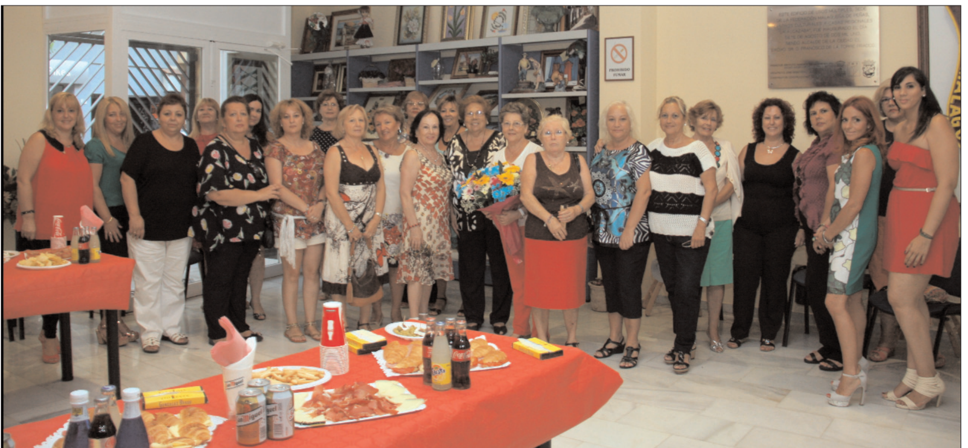
Participantes en esta primera merienda de mujeres celebrada en la sede de la Federación.

tantes muy agradables que esperan poder repetir en nuevas ocasiones.