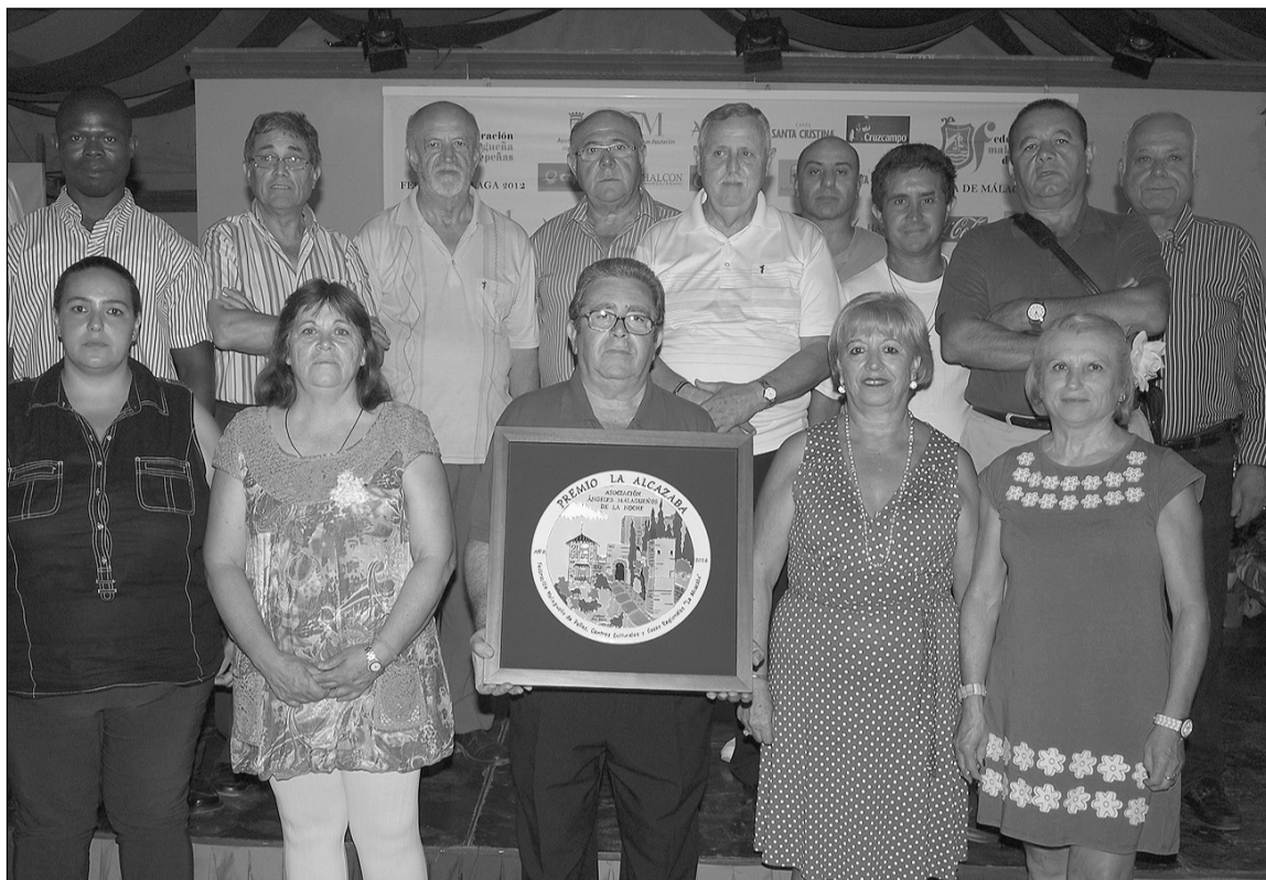
Voluntarios de los Ángeles Malagueños de la Noche, Premio La Alcazaba 2012.