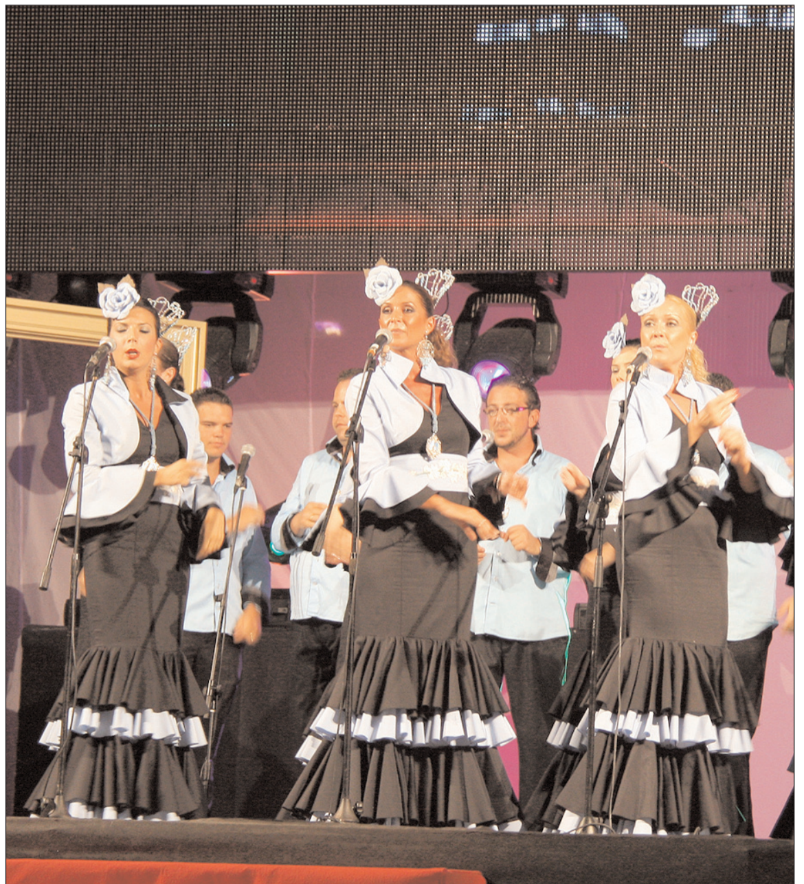
El Coro Nuestra Señora de Gracia volverá a actuar en la gala como ganador del Certamen de Malagueñas 2013.