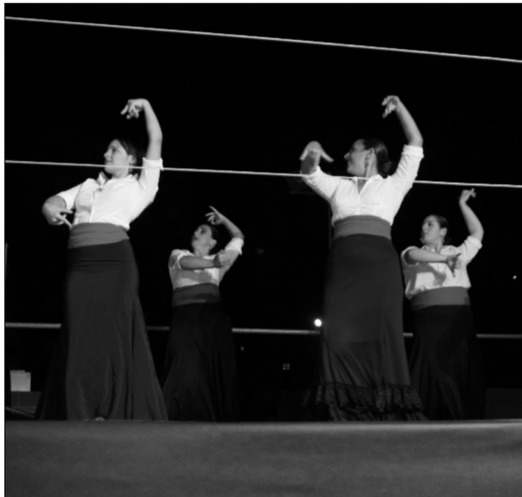
Un grupo en el Certamen de Malagueñas de Fiesta.