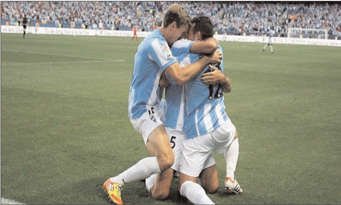
Jugadores malaguistas celebran un gol en La Rosaleda.