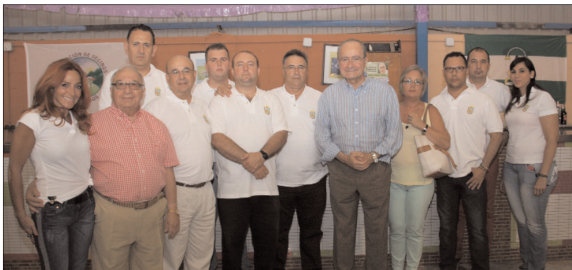
Los directivos de la Federación Malagueña de Peñas sirvieron la barra.