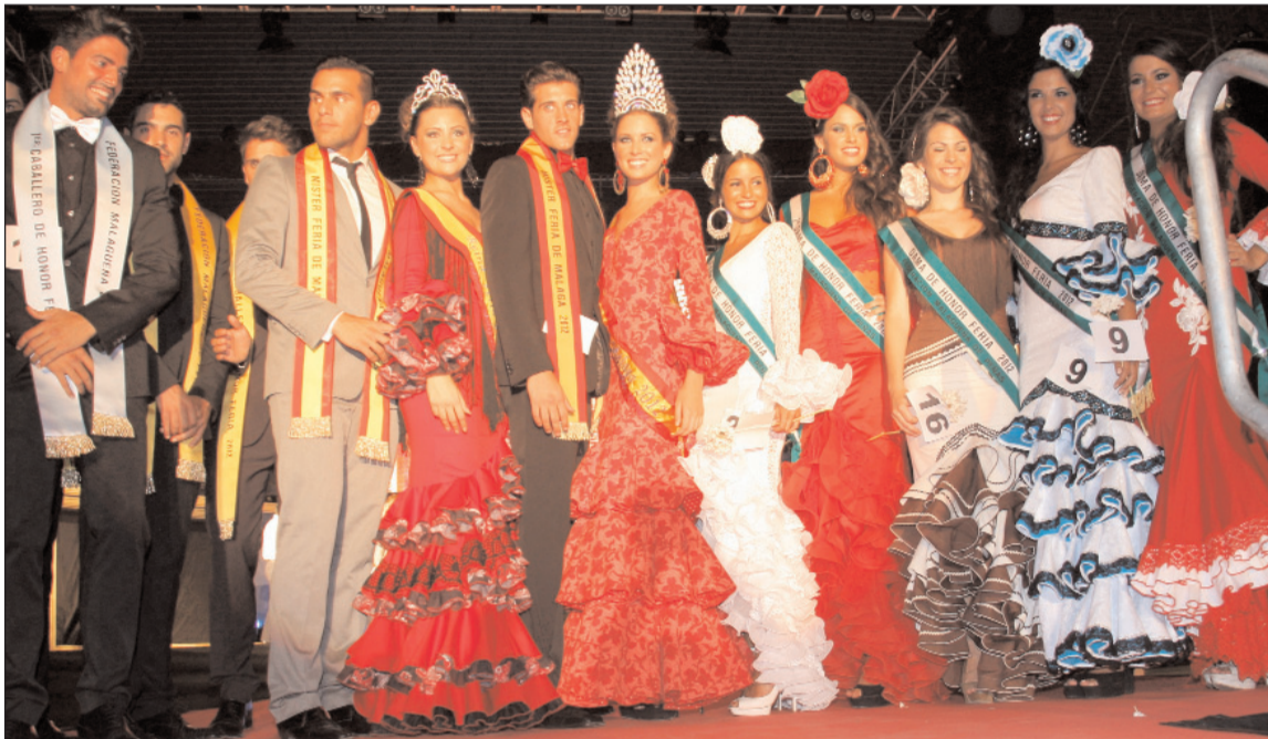
Los premiados en la edición de 2012.