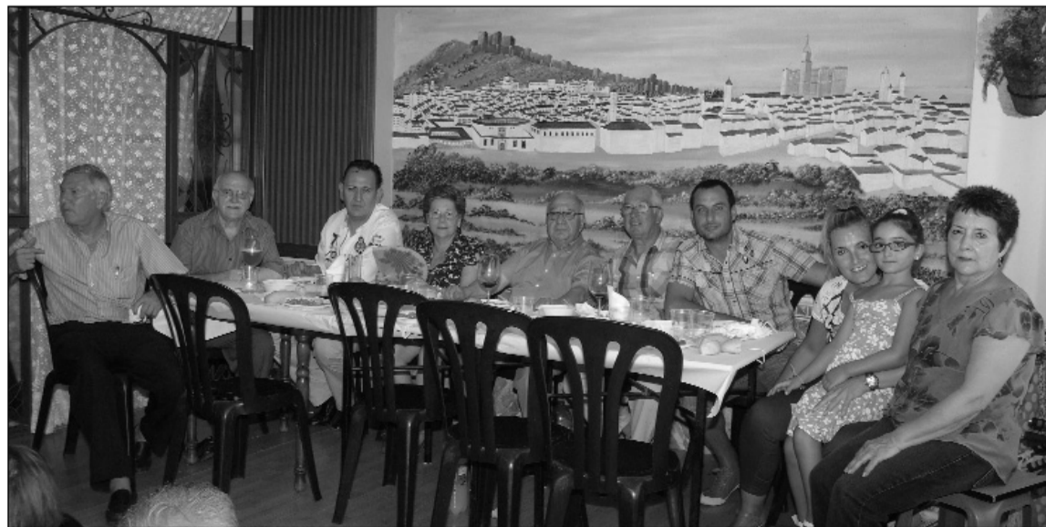
Mesa presidencial en la comida de hermandad.