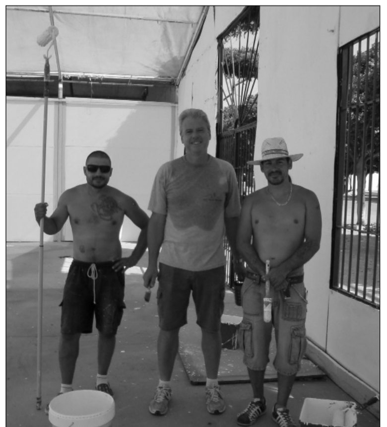
Peñistas dando una mano de pintura a su caseta.