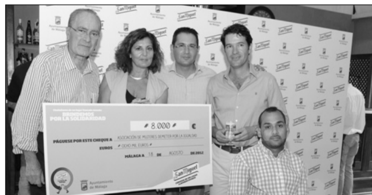
Entrega del premio en una edición anterior.

El nombre "Memorial José María Martín Carpena" se acordó en la edición del año 2000, en reconocimiento a la labor del concejal malagueño asesinado.