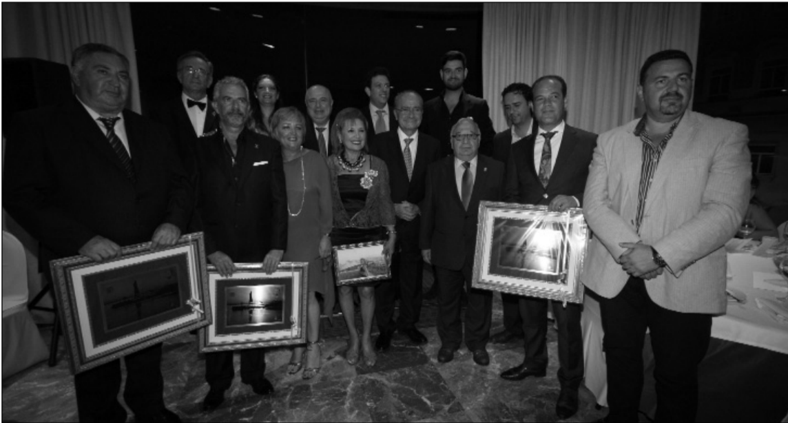
Premiados, junto a autoridades e invitados a este acto.