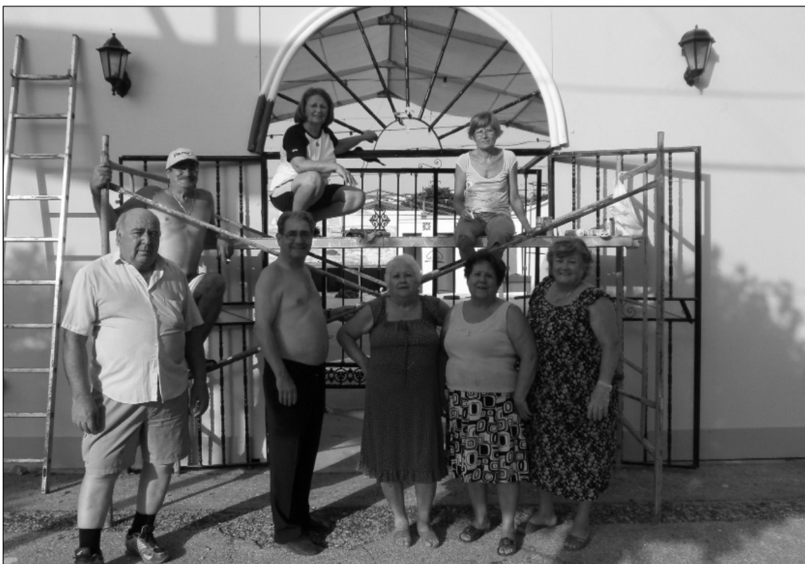
Hombres y mujeres trabajan por igual en el montaje de las casetas.

En la anterior edición, el primer premio en la modalidad de interiores fue la Peña El Parral;