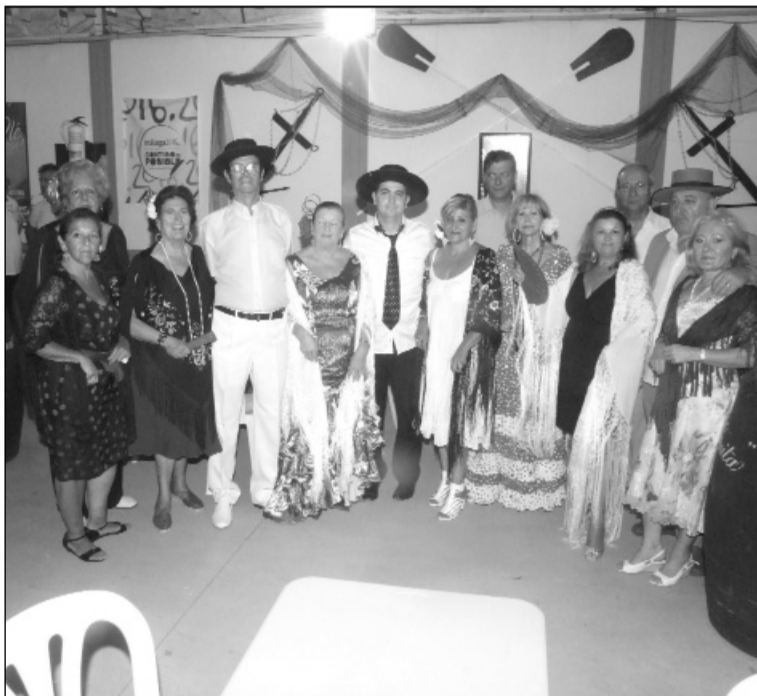
Imagen de archivo de un concurso de mantones y sombreros.