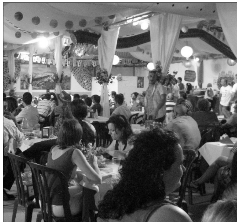
Aspecto de la caseta de la Peña El Sombrero en una edición anterior.

El habitual libro de Feria cuenta este año con una portada muy especial, ocupada por cua-