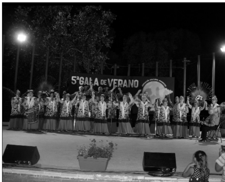
Uno de los coros participantes.