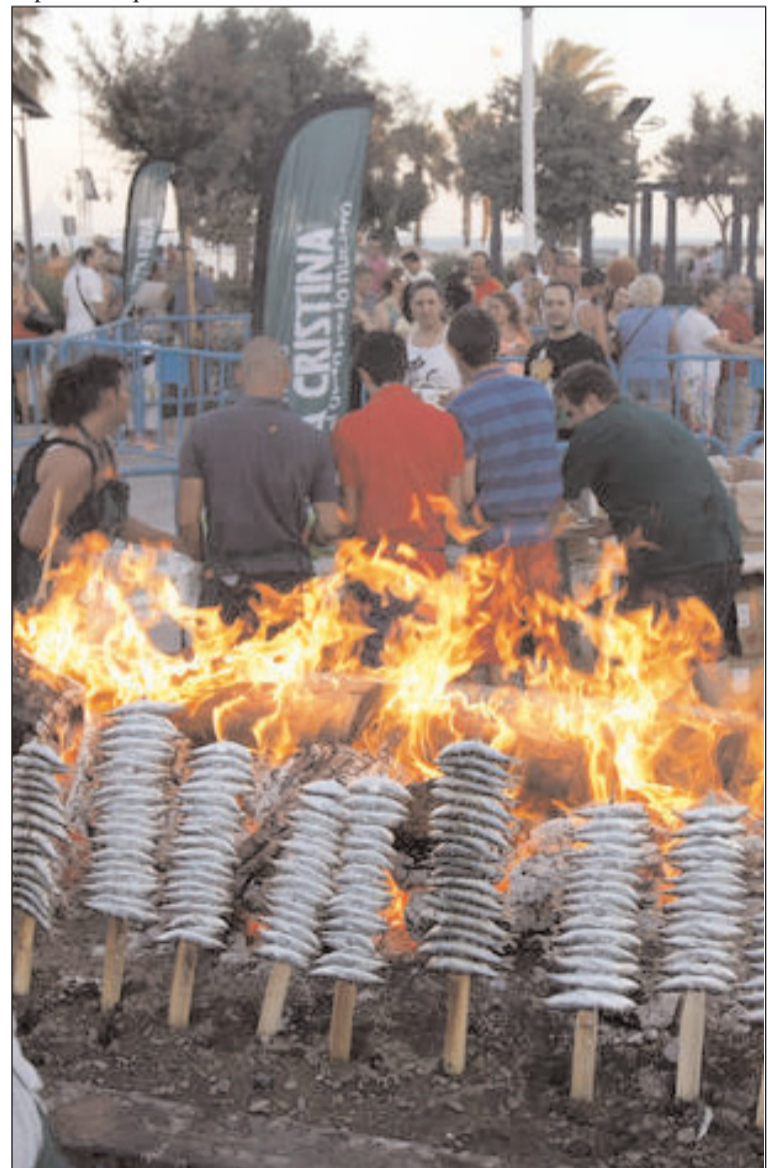
Cientos de malagueños degustaron estos espetos.

Así, las sardinas estuvieron acompañadas con su maridaje de pan con aceite y, como no podía ser de otros como, con el café que se ofreció de forma gratuita a cientos de malagueños.