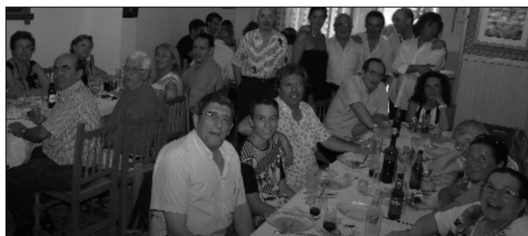
Socios de la Peña Flamenca Fosforito.