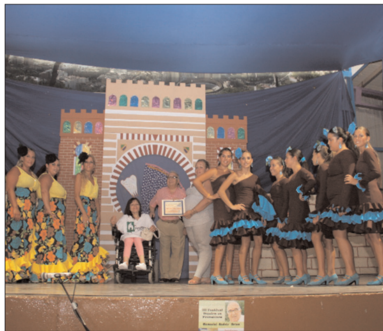
Un instante del acto.

El objetivo de esta actividad, en la que se contó con la presencia del alcalde de Málaga, Francisco de la Torre, además de la concejala Teresa Porrás o el presidente de la Federación de Peñas, Miguel Carmona, era recaudar fondos para terminar de pagar una furgoneta adaptada que la asociación ha comprado y poder atender así el transporte de los discapacitados con los que trabajan.