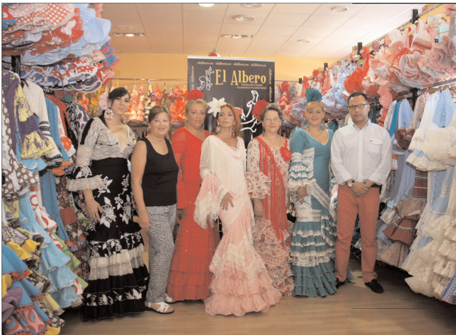
Prueba de vestidos de flamenca.

Las instalaciones de El Albero cuentan con más de 200 metros de una moderna sala de venta en la que se exponen las más prestigiosas colecciones de moda flamenca. En El Albero también se cuenta con facilidad de aparcamiento y una garantía de compra en el sector única.