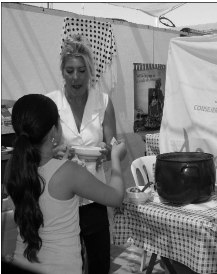
Una degustación gastronómica en una mañana de feria.