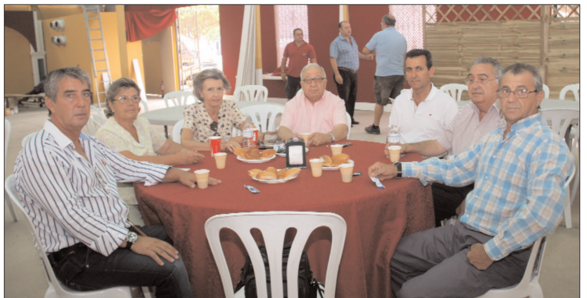
Al término de la presentación de actividades se ofreció un desayuno.