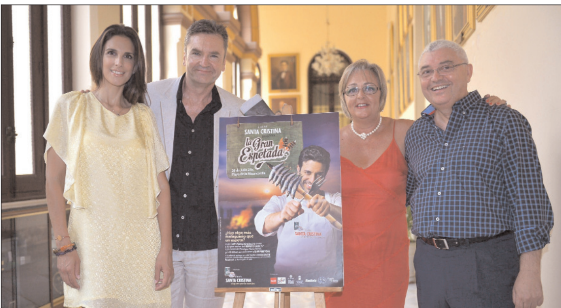
La presentación de este evento contó con la presencia de la cantante Nuria Fergó, que ejerció de madrina.