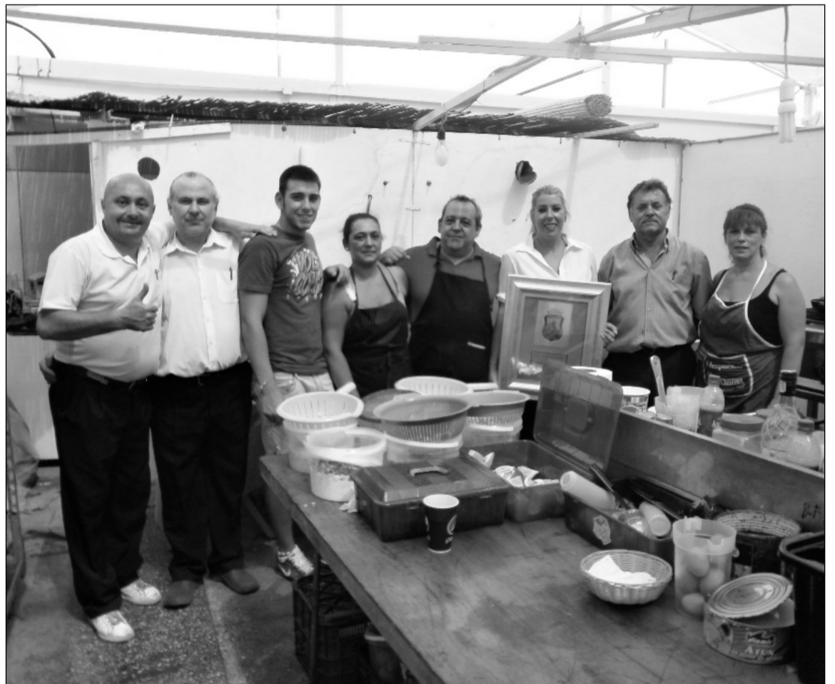
Socios de la Peña Los Pastores de Colmenarejo con su premio del pasado año en la cocina de su caseta.