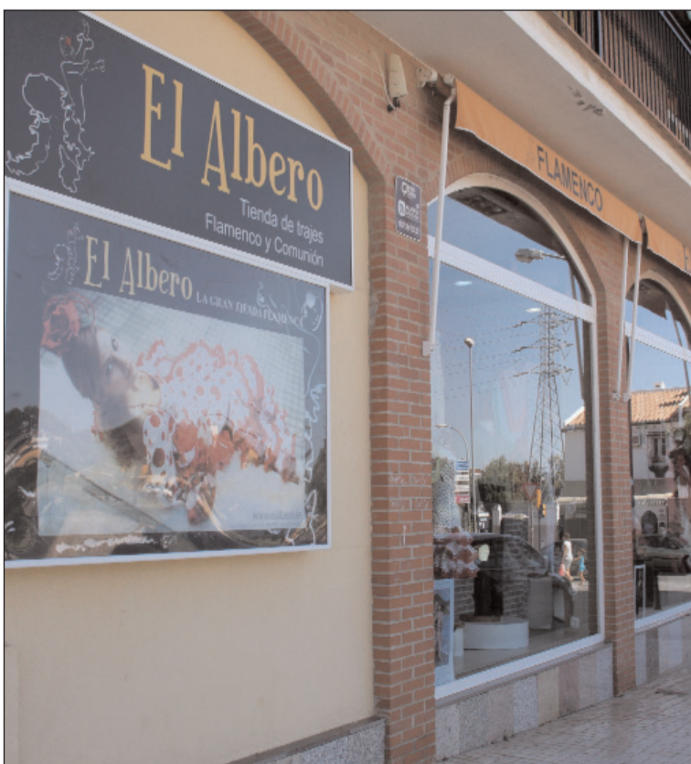
Instalaciones de El Albero.