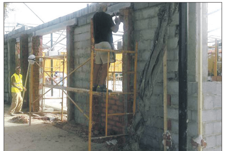
El cerramiento abarca las calles Antonio Rodríguez y Eusebio Valderrama.

aquella instituciones que desee nuestro Ayuntamiento.