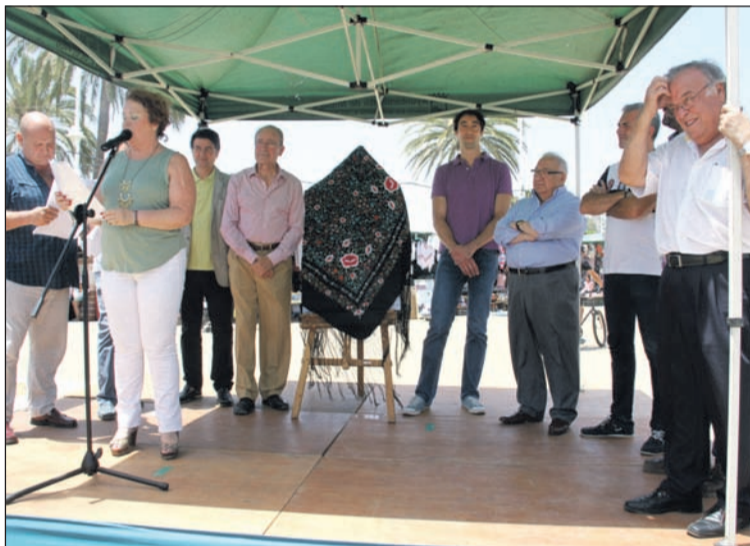
Intervención de la presidenta durante el acto de presentación.