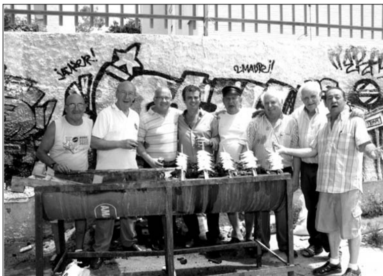
Peñistas junto a los espetos.

un almuerzo en el que los socios de ambas entidades pertenecientes a la Federación Malagueña de Peñas, Centros Culturales y Casas Regionales 'La Alcazaba' degustaron espetos de sardinas y una fideguá.