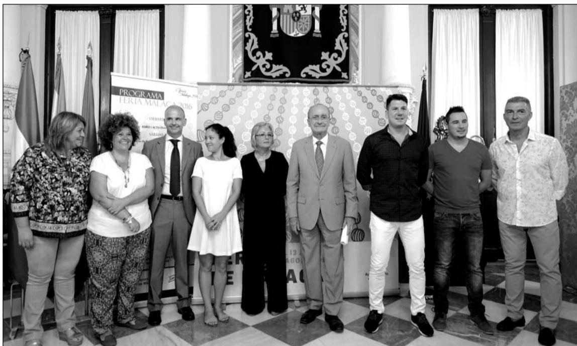
Acto de presentación de las actuaciones en el Auditorio durante la Feria.

Todas las galas del Auditorio Municipal abrirán con una Muestra de Bailes Malagueños y Flamencos de las distintas academias locales.