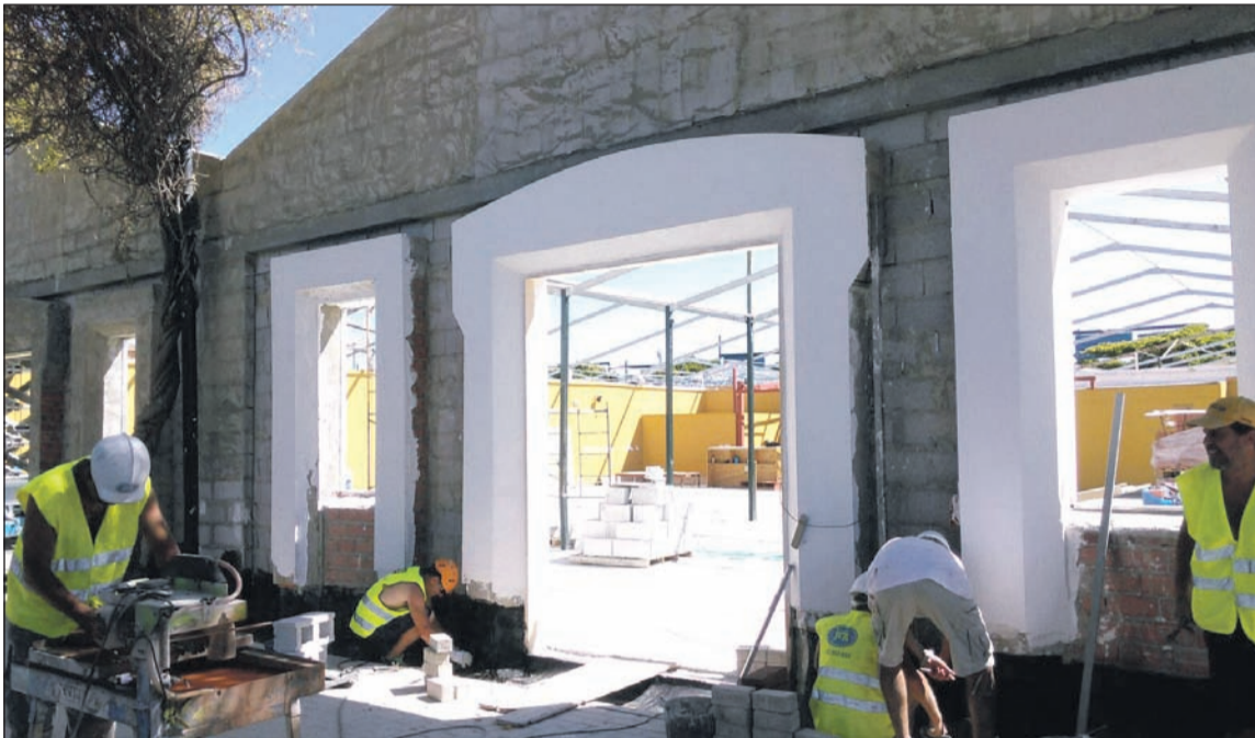
La fachada ya se está levantando en la primera fase de los trabajos.