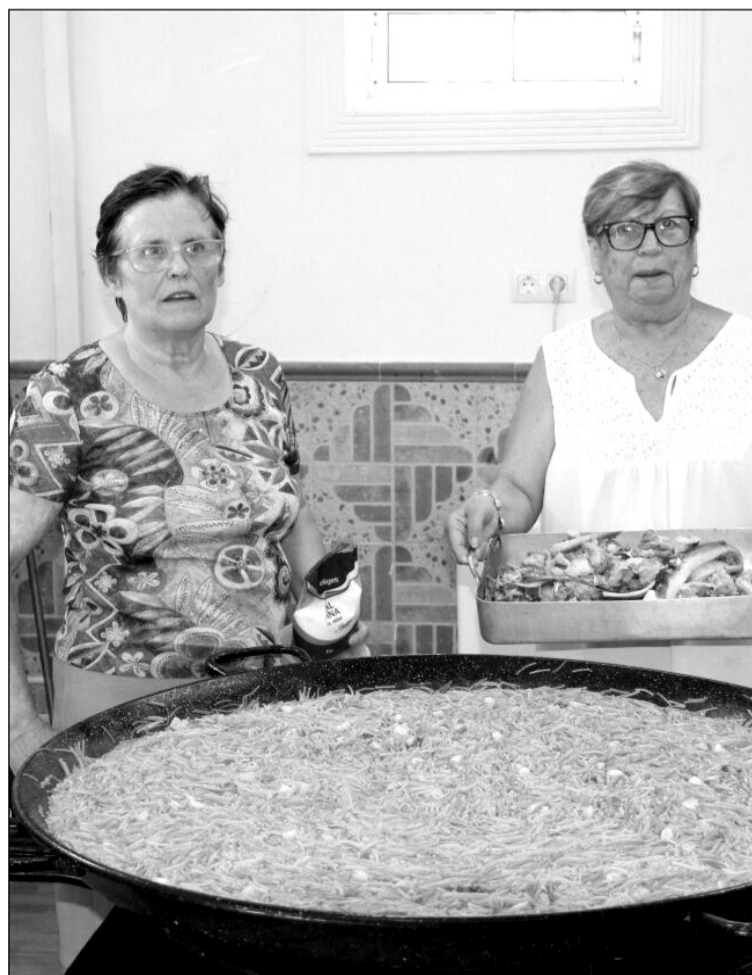
Preparando la fideguá.