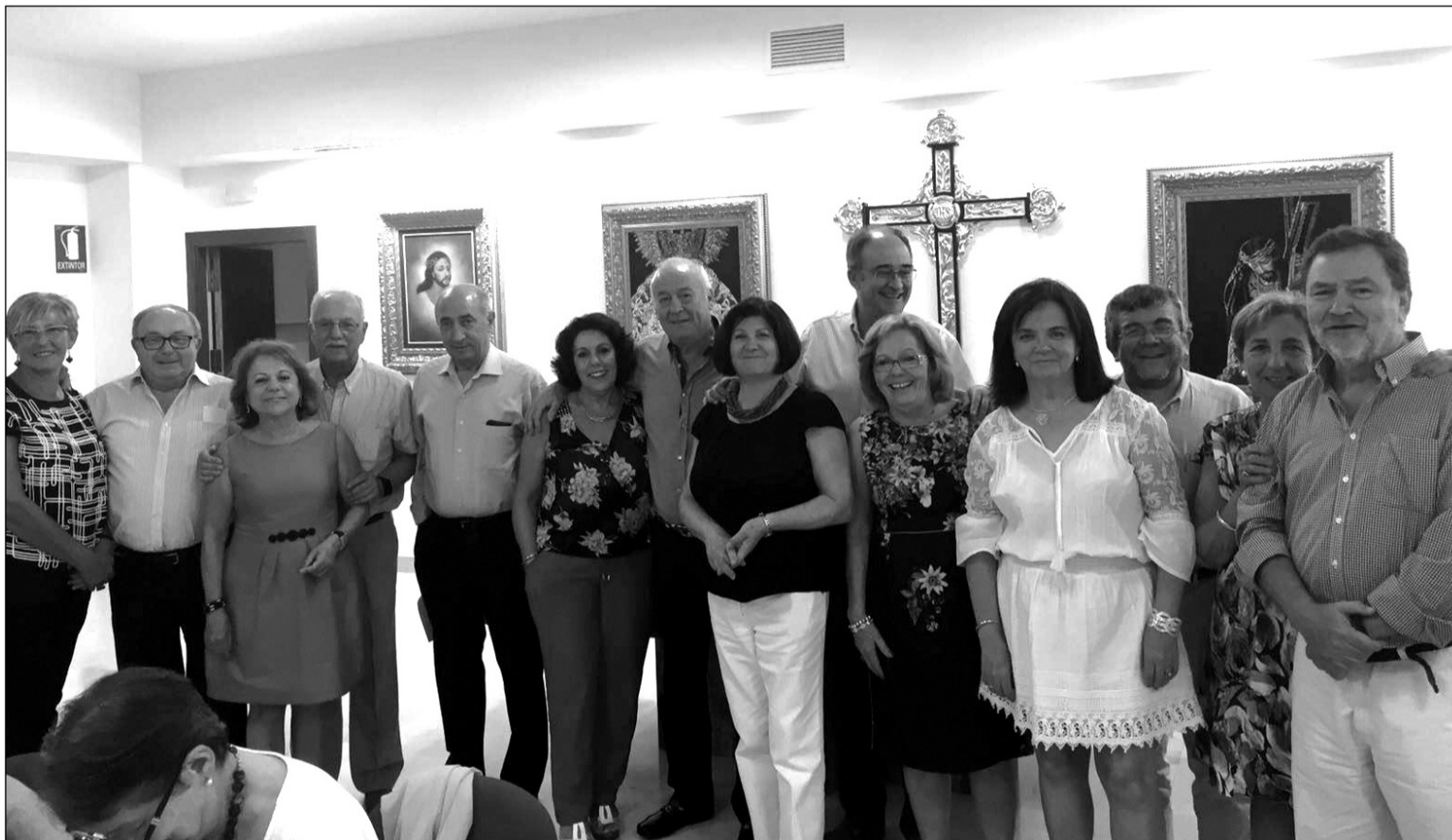
Algunos de los asistentes a la cena benéfica celebrada el pasado 2 de julio.