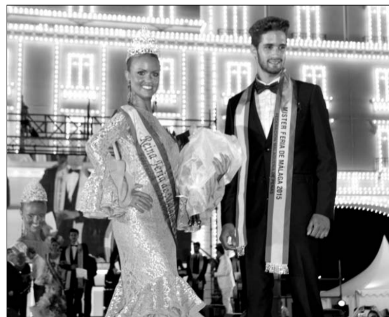
Elección de la Reina y el Mister del pasado año.

Igualmente, se mantendrán otras actividades tradicionales como los concursos de embellecimiento de casetas, el de ambientación, el de Por Malagueñas, o la entrega de los galardones 'La Alcazaba' y Málaga por bandera'.