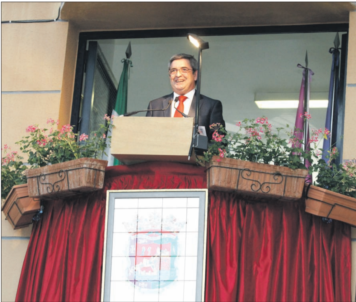
El pregonero, desde el balcón de la junta municipal de distrito de Campanillas.