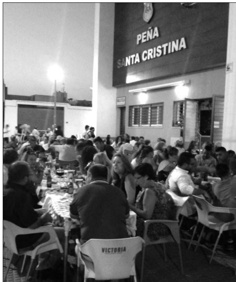
Ambiente en el exterior de la sede de la Peña Santa Cristina.