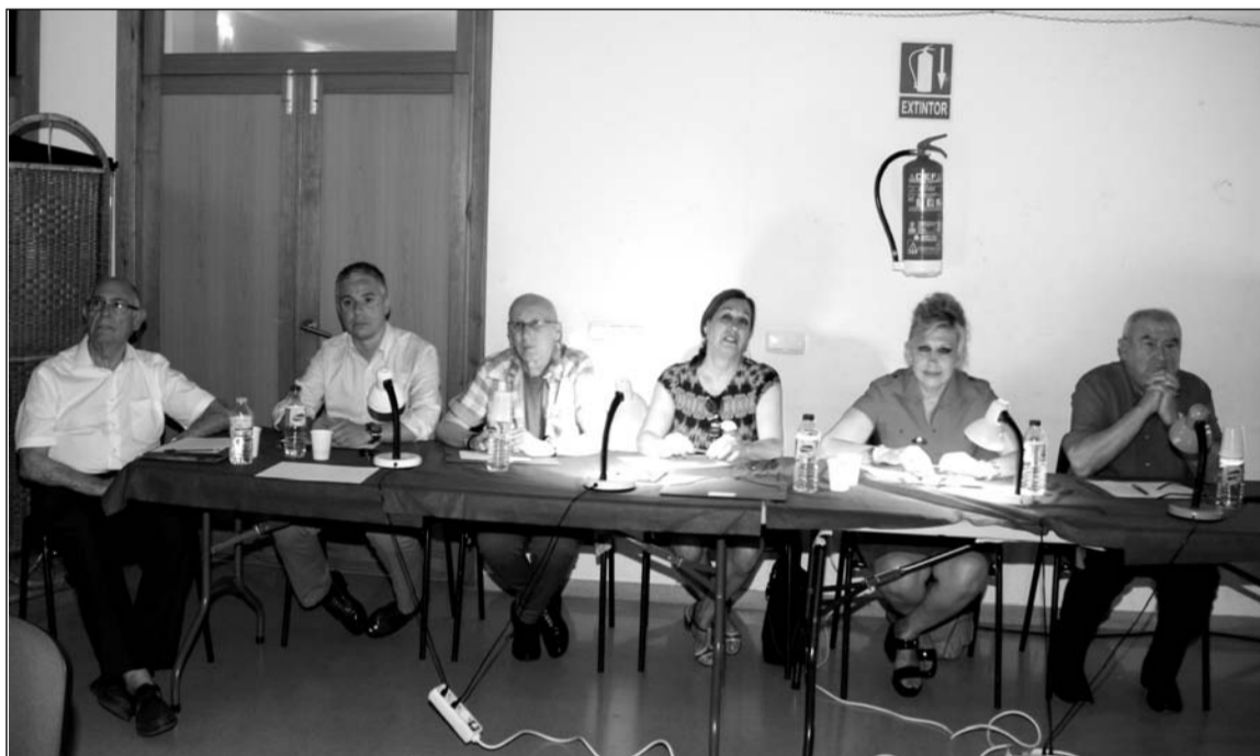
Miembros del jurado durante una de las semifinales del concurso.