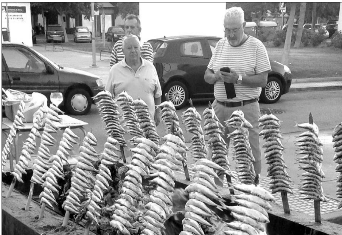
Preparativos de los espetos que se degustaron en la veladilla.

En total fueron cerca de un centenar de personas los que disfrutaron de una jornada muy agradable al aire libre.