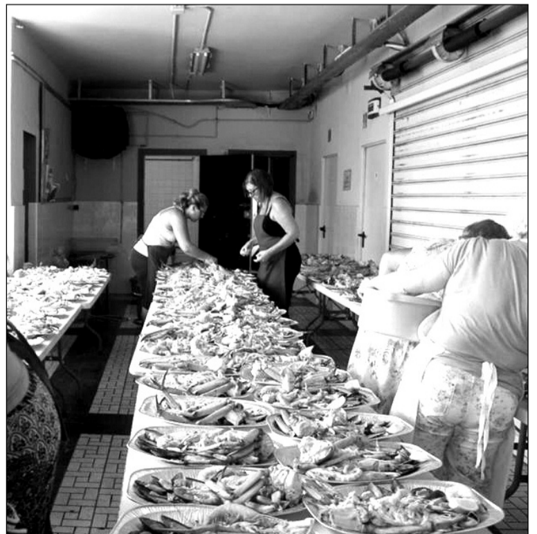
Preparativos de la mariscada por los socios de la entidad.