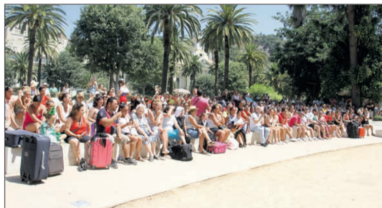
Público disfrutando del espectáculo a pesar de las altas temperaturas.