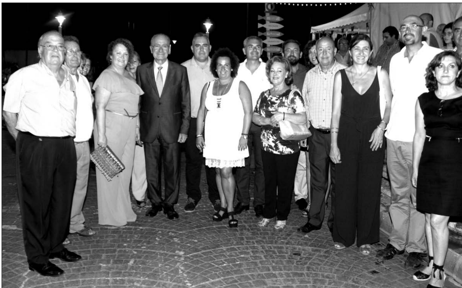
Autoridades y peñistas en el acto de inauguración de la Feria.