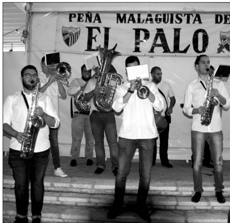
Una charanga actúa ante la caseta de la Peña Malaguista de El Palo,

Virginia, con la organización de la Asociación de Vecinos y las peñas.