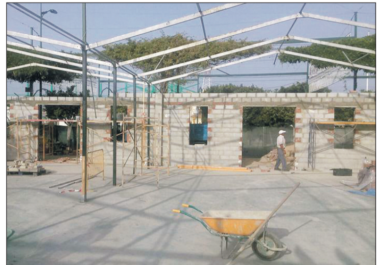
Estado de los trabajos a mediados de la pasada semana, desde el interior.

Estos trabajos de construcción de la caseta de la Federación se harán por fases y serán para uso y disfrute de los asociados a este colectivo y de