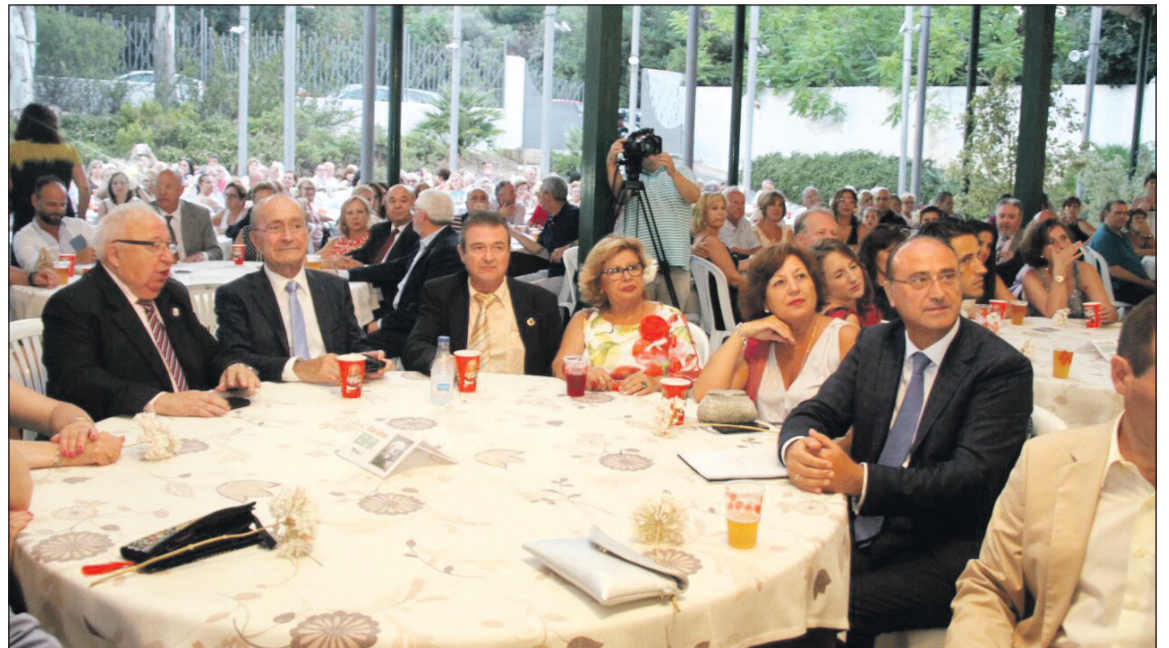
Mesa presidencial en la Fiesta de la Biznaga 2016.