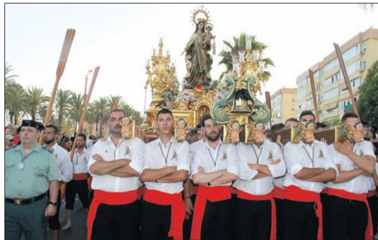
La Virgen del Carmen, durante el acto ofrecido por la Peña Costa del Sol.