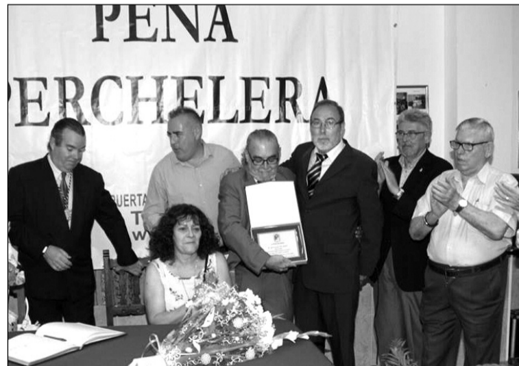
Reconocimiento al pregonero en la sede.