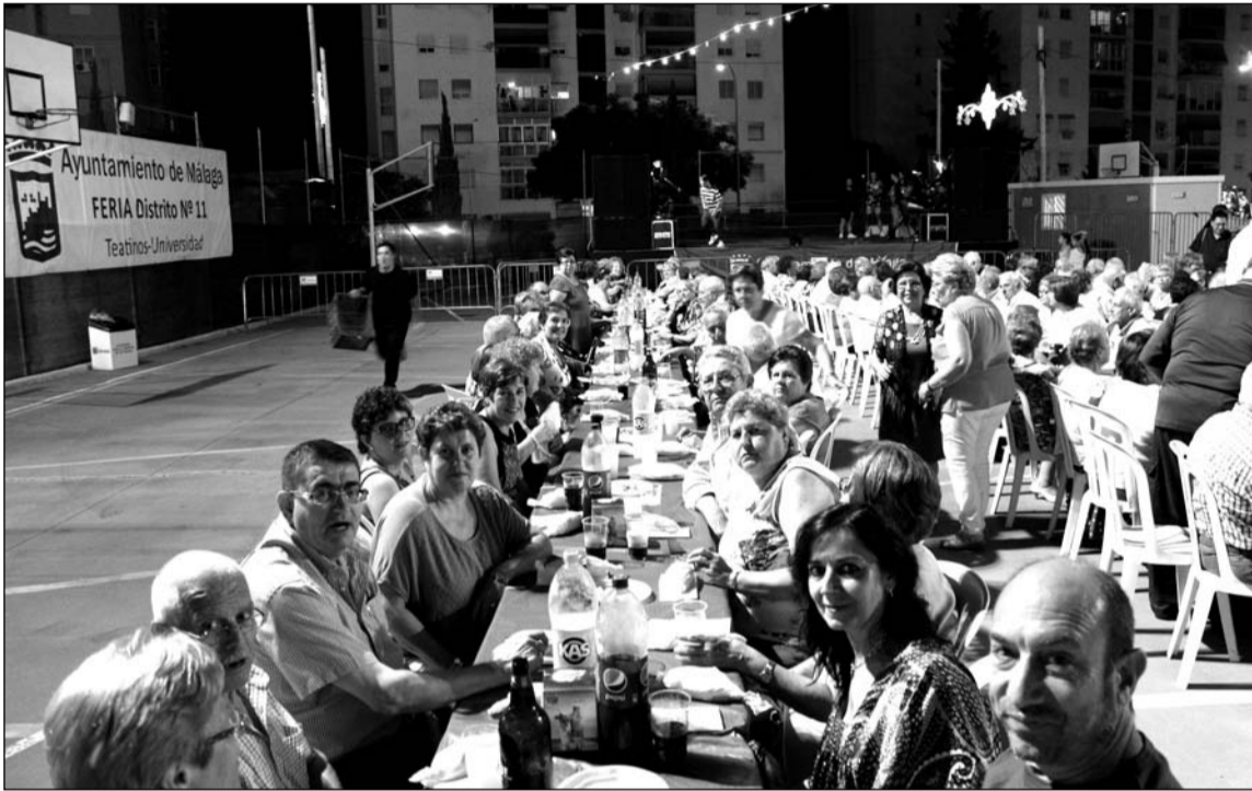
Participantes en la cena de homenaje a los mayores del distrito.