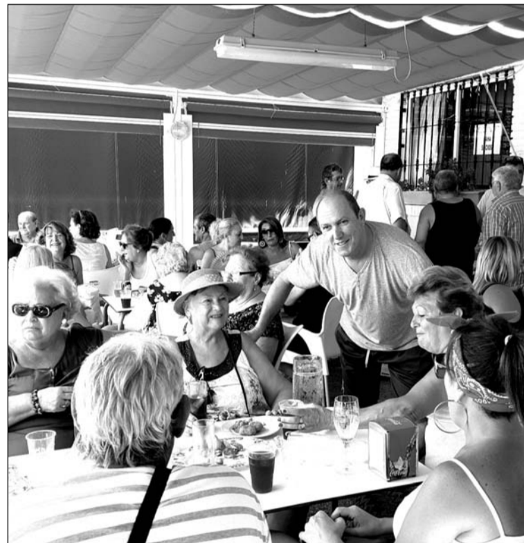
Ambiente en el exterior de la sede.

Peñas, Centros Culturales y Casas Regionales 'La Alcazaba', que se reunieron para degustar una fideguá. Se contó con un gran número de asistentes, acordándose que la próxima invitación de la entidad a sus socios consistirá en una gran caracolada, de nuevo en la terraza de la peña.