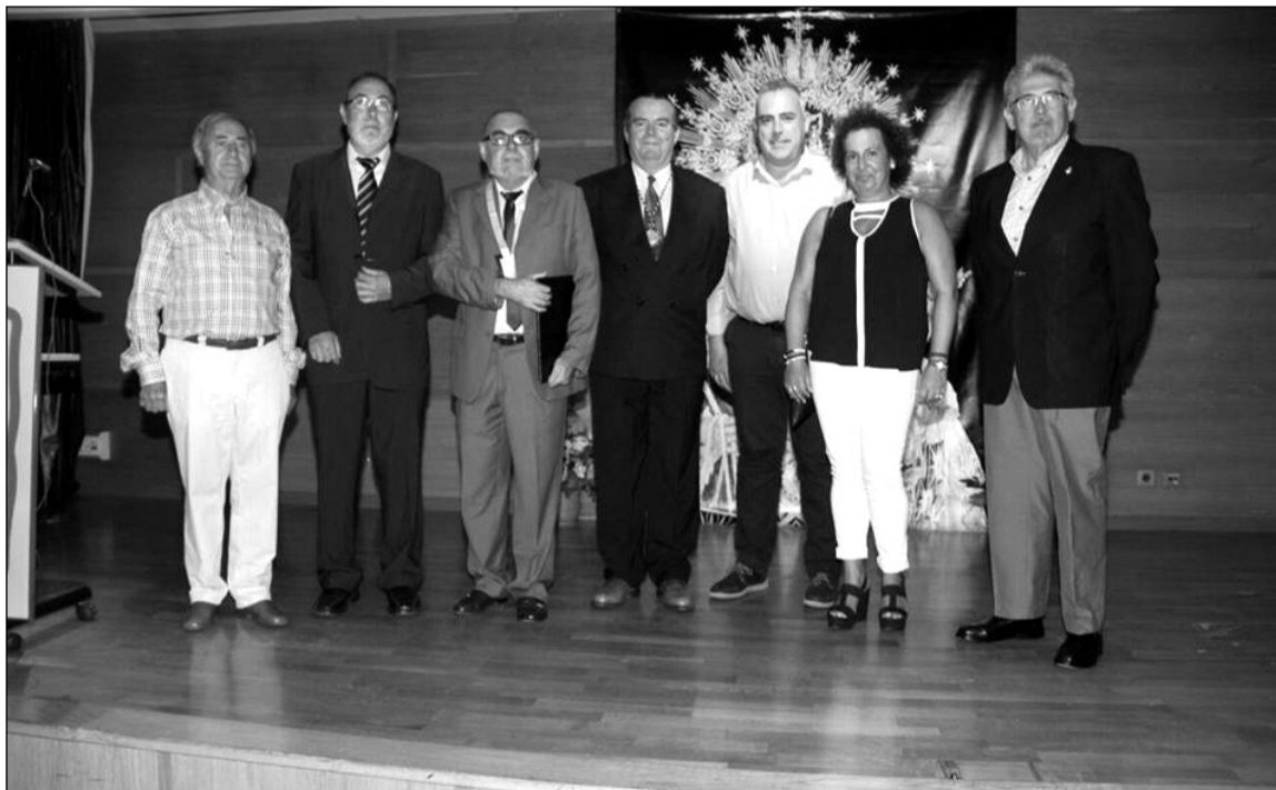
Pregón marinero celebrado en el salón de actos de la ONCE,

Hay seis premios para los finalistas, estando dotado el primero con 500 euros, el segundo con 300, el tercero con 200, el cuarto con 100 y dos premios para el quinto y sexto puesto de 50 euros cada uno.