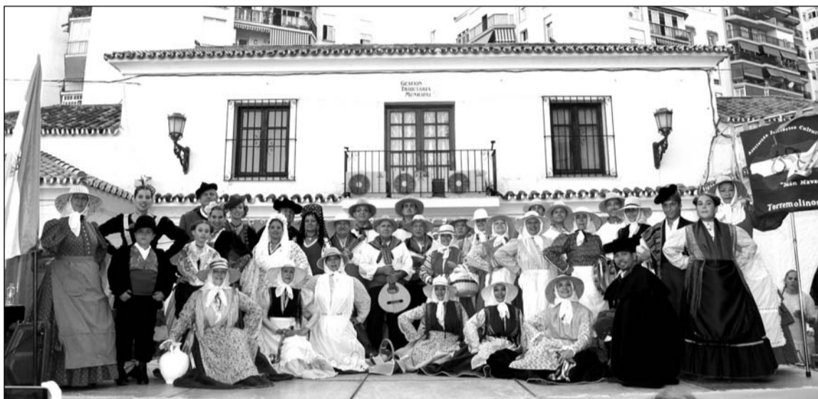
Uno de los grupos actuantes, tras realizar el pasacalles.