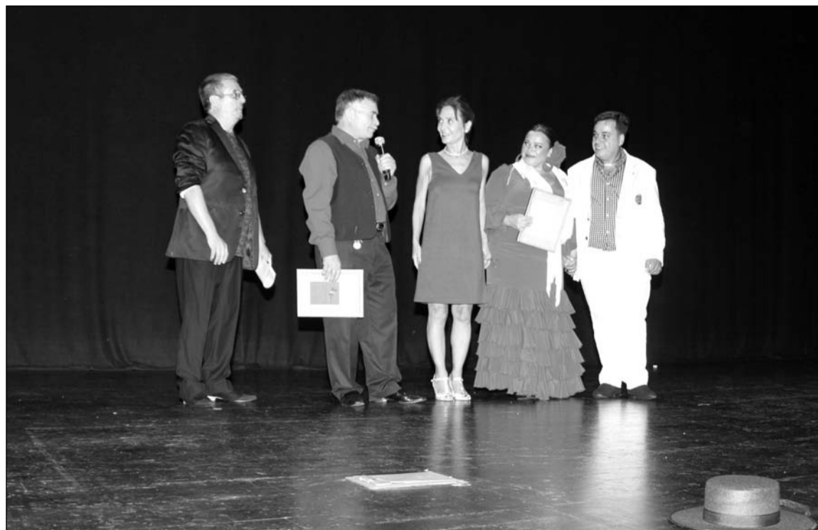
Un instante de la gala celebrada en el Auditorio Edgar Neville de la Diputación.