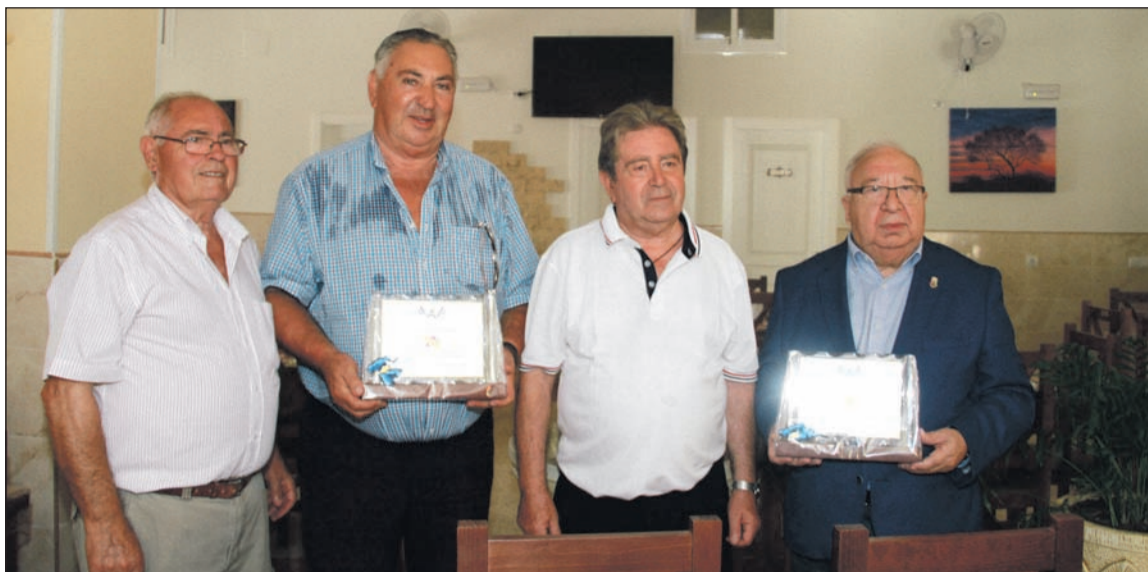
Entrega de reconocimientos a la Federación de Peñas Flamencas y la Federación Malagueña de Peñas.