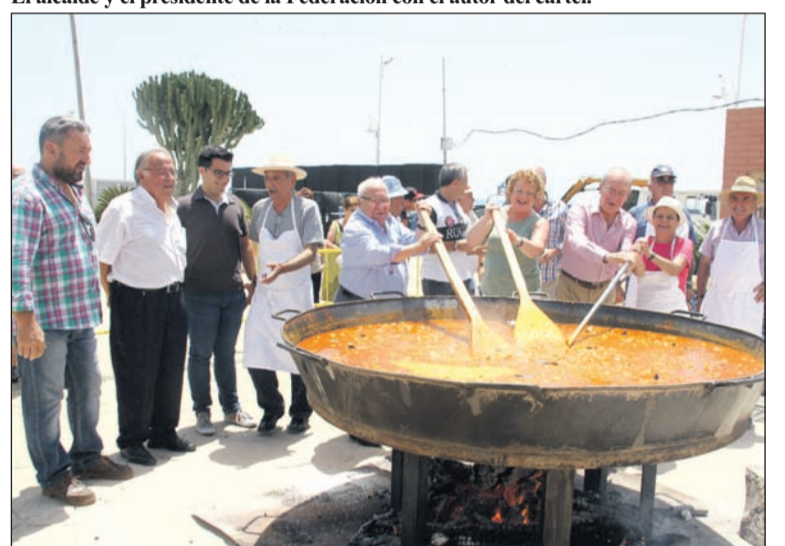
Preparativos de la gran paella popular.