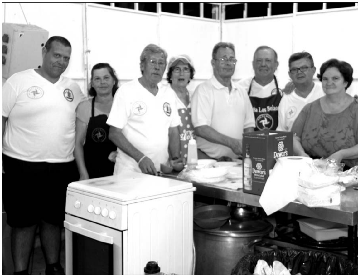
Socios de la Peña Los Bolaos atienden su caseta.