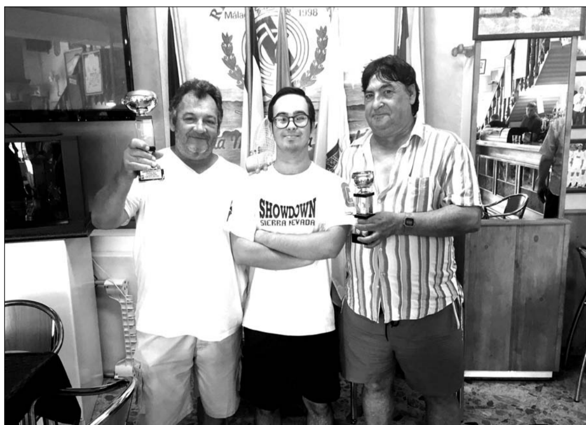
Entrega de trofeos a los ganadores del Concurso de Rana.

La entrega de trofeos a los ganadores, por su parte, está anunciada para la jornada del jueves 11 de agosto, a partir de las 21 horas, en la sede de esta entidad federada.