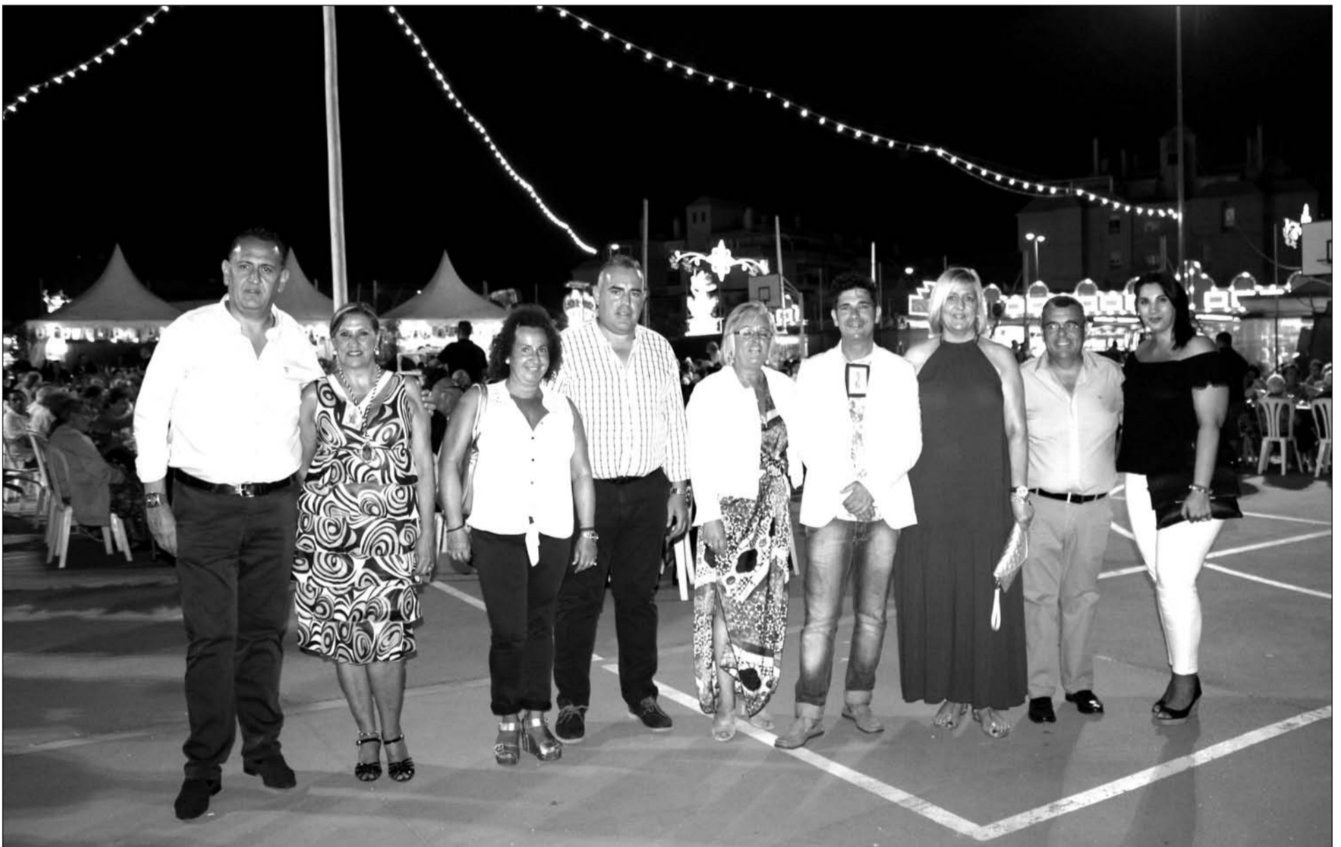
Representantes de la Federación Malagueña de Peñas con las autoridades del distrito Teatinos Universidad y el pregonero de las fiestas.