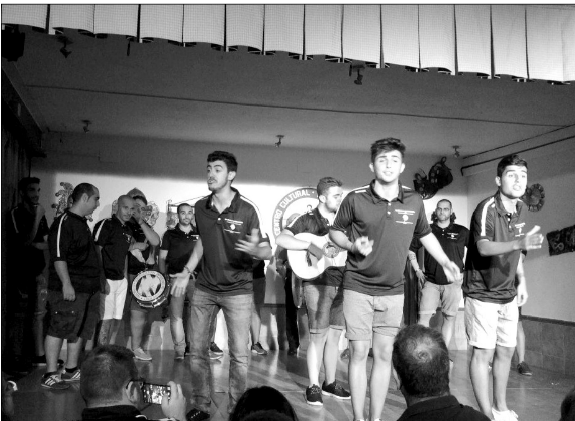
Actuación de la Comparsa La Bella Durmiente.