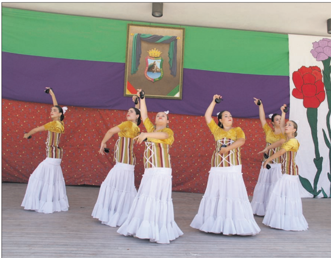
Uno de los grupos participantes en el escenario del auditorio Eduardo Ocón.