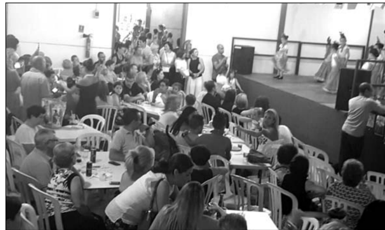
Gran ambiente para disfrutar de los grupos de baile.

Este ha sido el caso de la Peña El Tomillar, que ha ofrecido actuaciones de baile y que procedía a la elección de su reina y rey infantil.