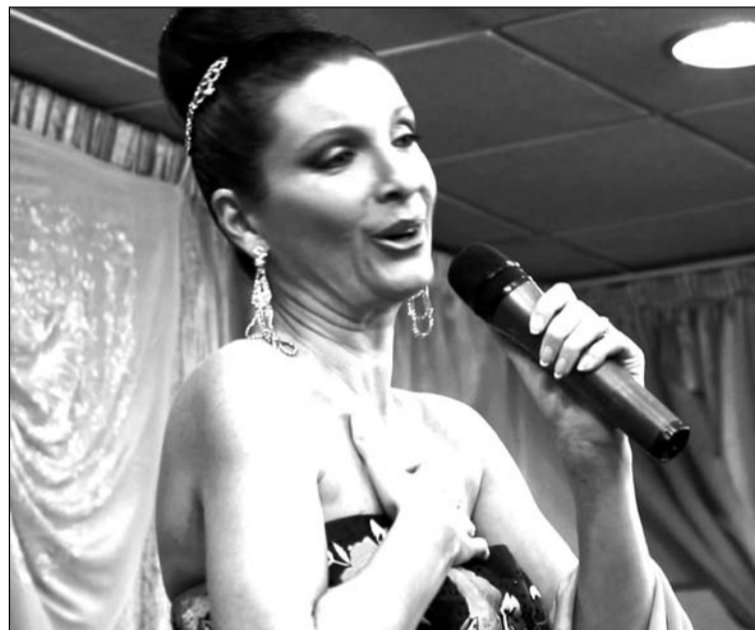
Imagen de archivo de la cantante Rocío Alba.