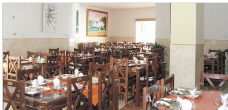
Nuevas instalaciones con las que cuentan los Ángeles Malagueños de la Noche.