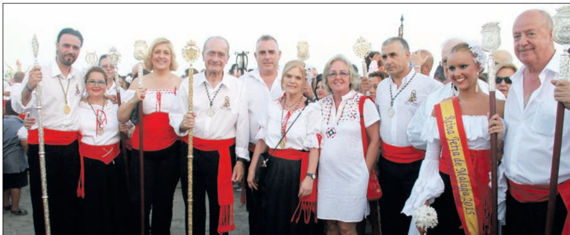
Representación peñista en la procesión con autoridades municipales.