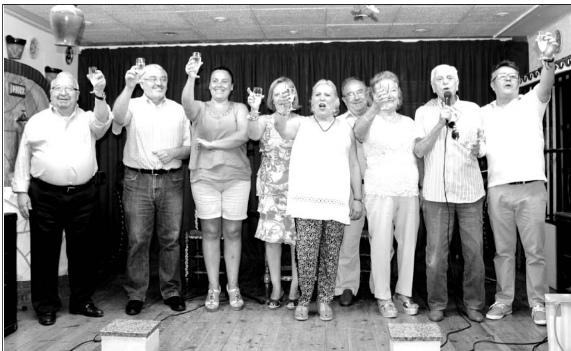
Brindis de los asistentes a la comida de hermandad de la Peña El Parral.