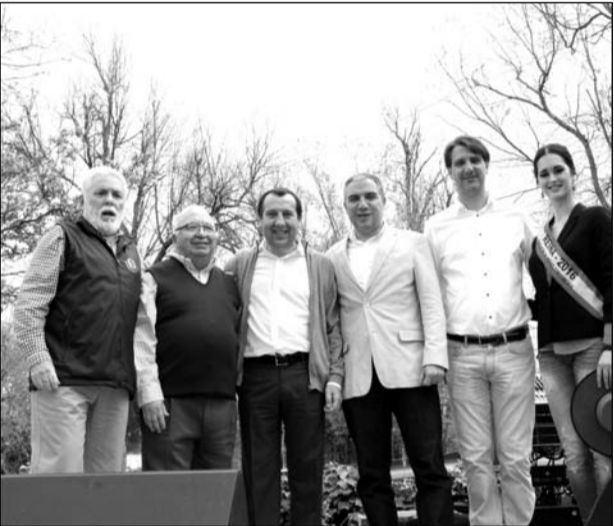
Los dos presidentes con autoridades y la reina cordobesa.