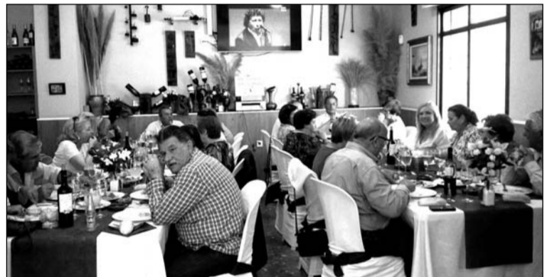
Comida de hermandad por el Día de la Madre.