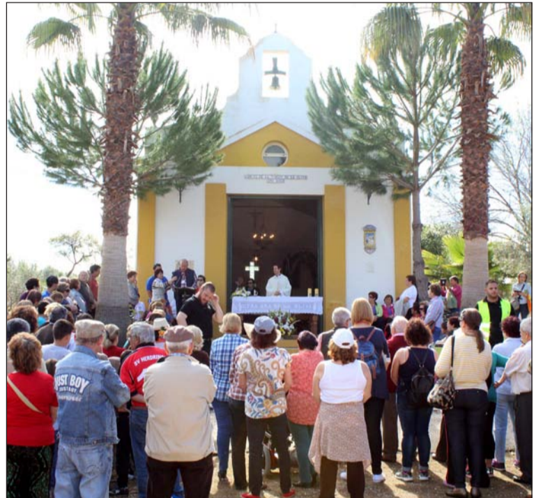
Misa Rociera ante la Ermita de la Virgen de la Oliva.