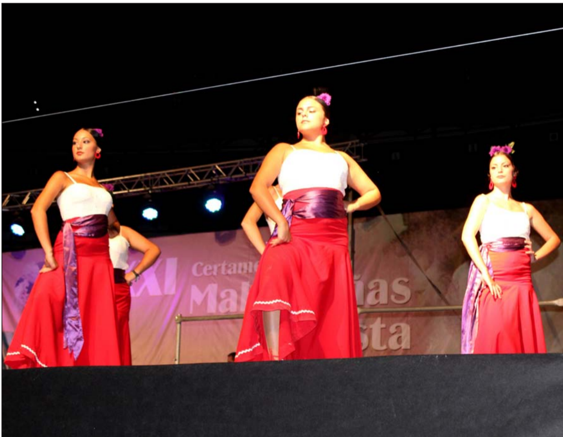
Un grupo de baile sobre el escenario de la plaza de toros de La Malagueta.