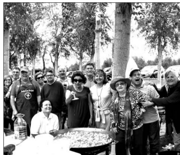
Preparativos del arroz preparado por la Peña Los Bolaos.