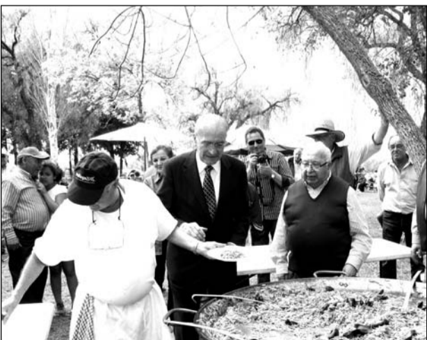
El alcalde prueba la fideguá preparada por la Peña El Palustre.