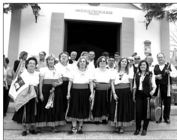
Panda de Verdiales ante la Ermita de la Virgen de la Oliva.