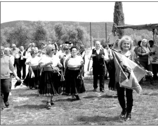
Panda de Verdiales de la Peña La Paz.