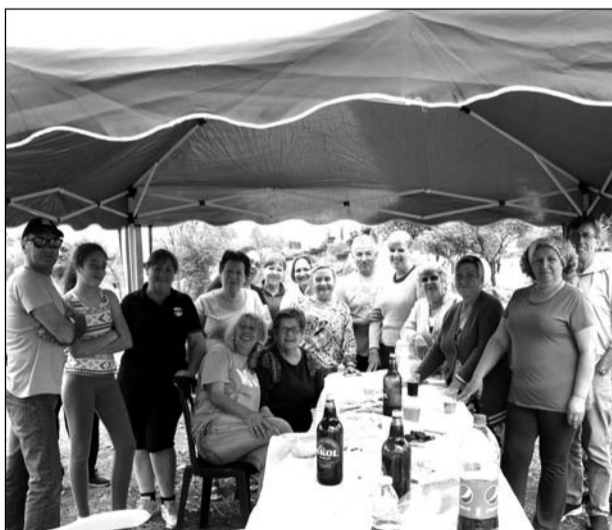
Socios de la Peña Santa Cristina, en el Parque Santillán.