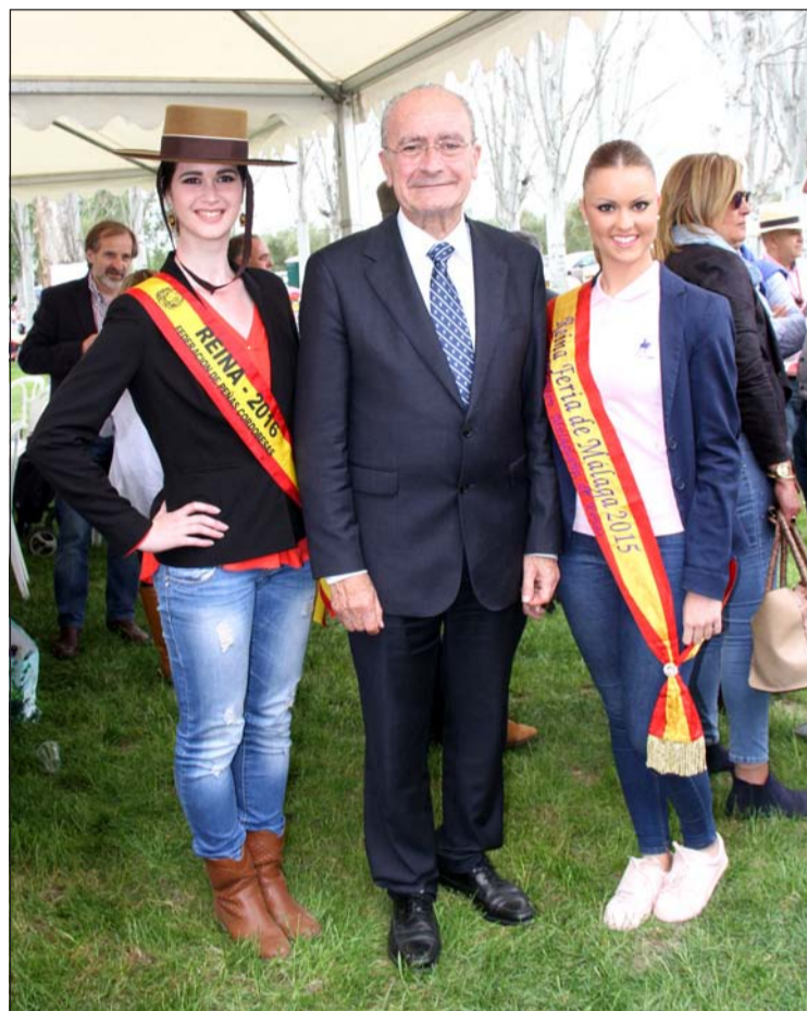
El alcalde de Málaga, Francisco de la Torre, con las reinas de las dos federaciones.