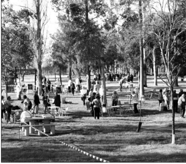
Las peñas, acomodándose en las parcelas que tenían reservadas.