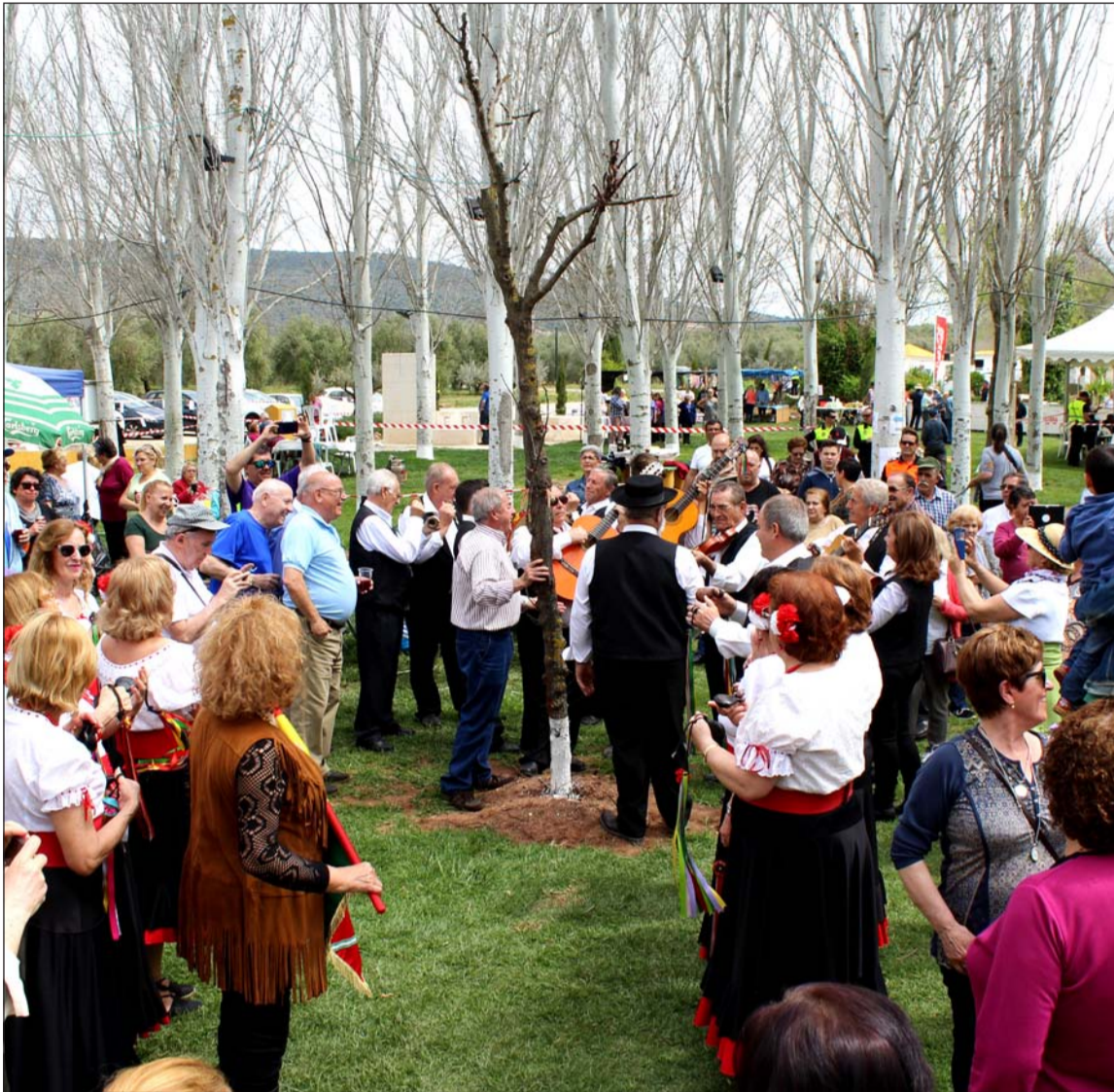
Baile de Verdiales en el Parque Santillán de Mollina.

◆ Federación Malagueña de Peñas, Centros Culturales y Casas Regionales 'La Alcazaba'