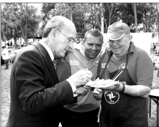
El alcalde prueba el arroz de la Peña Los Bolaos.