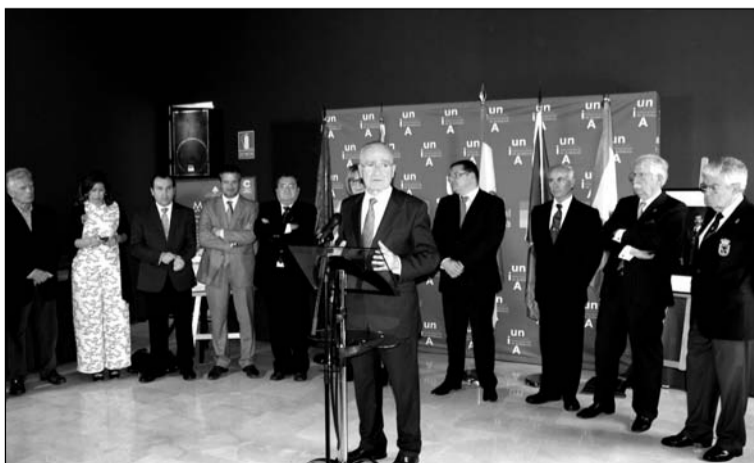
Intervención del alcalde en la inauguración.