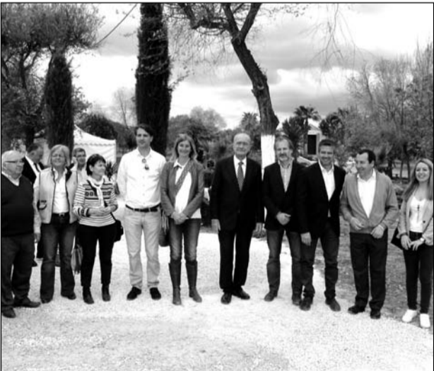
Llegada del alcalde de Málaga, con el resto de autoridades.