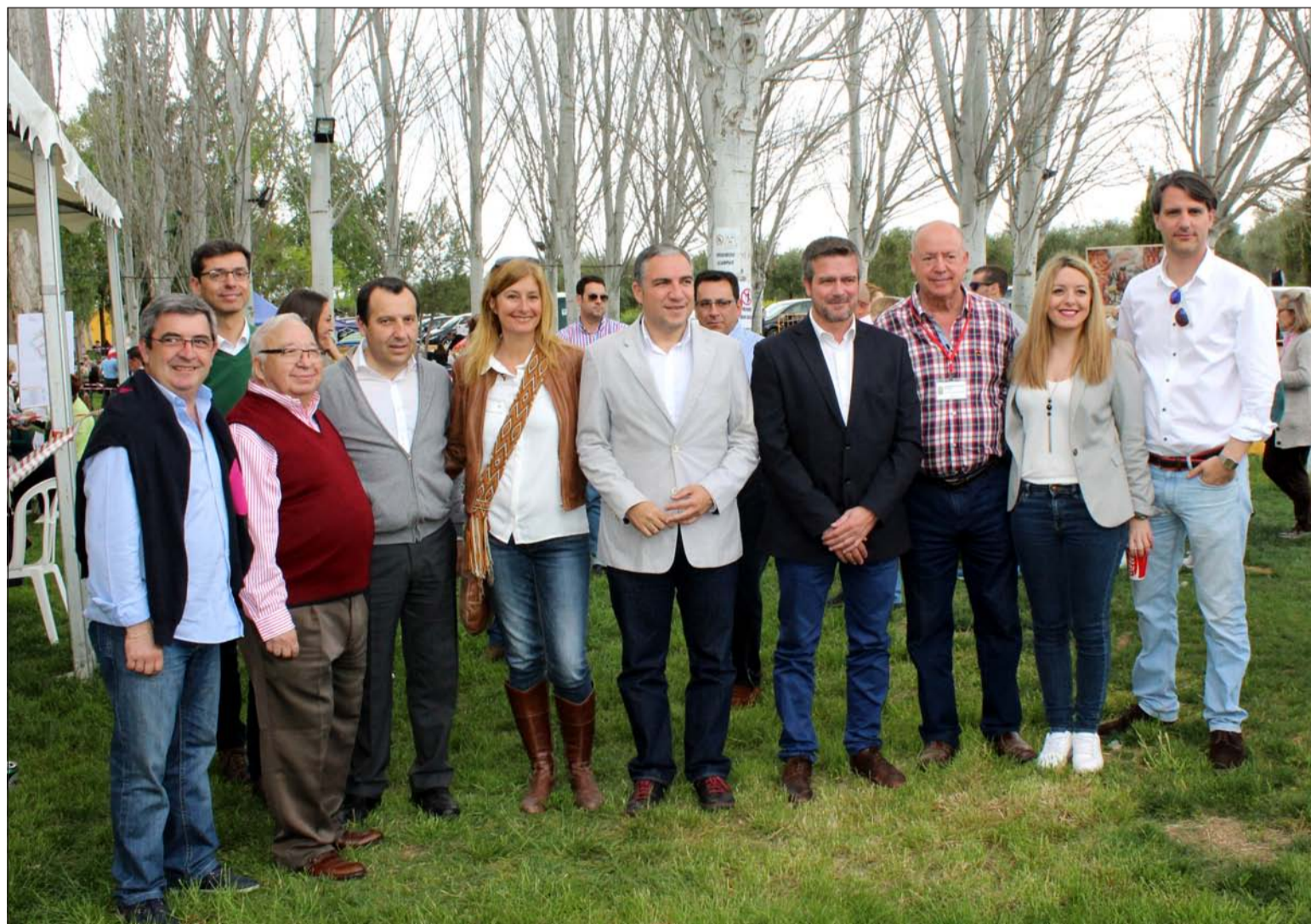
Algunas de las autoridades e invitados al acto de hermandad entre los peñistas malagueños y cordobeses.

consolide en el futuro y hacerla extensiva a peñas de las restantes provincias andaluzas, según indicaron en el transcurso de este acto de hermandad.