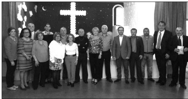
Asistentes a la inauguración de la Cruz de Mayo.