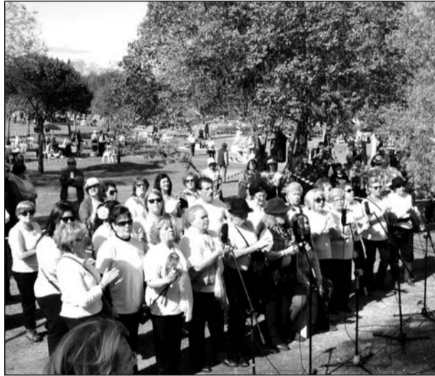
Coro de la Peña Cultural Flora cantando durante la misa.