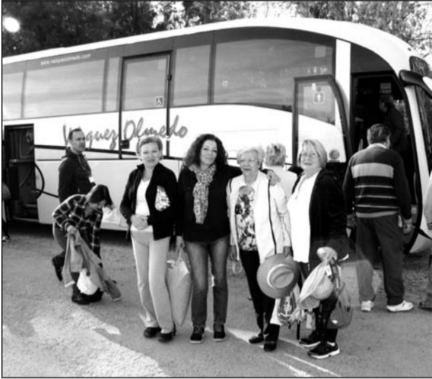
Llegada de los autobuses al Parque Santillán.