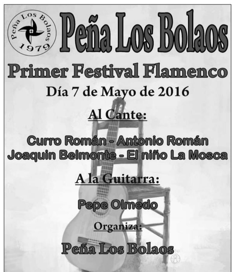
Cartel del Festival Flamenco del próximo sábado.