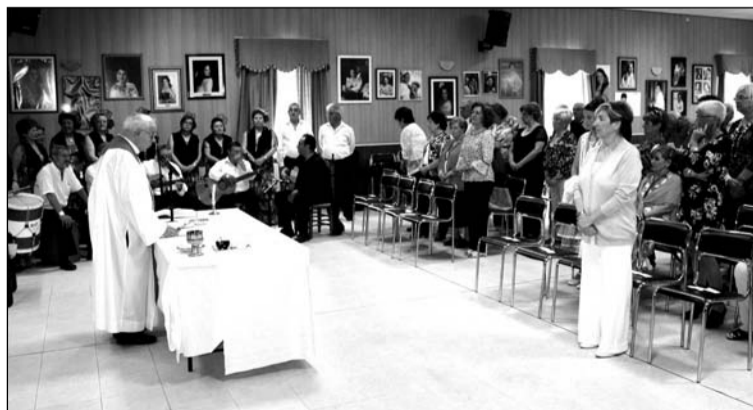
Misa oficiada en el salón de actos de la entidad.