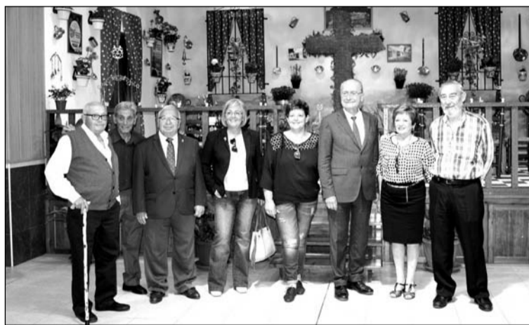
Asistentes a la inauguración de la Cruz de Mayo.