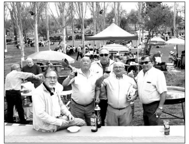
Peñistas brindan durante los preparativos de la comida.