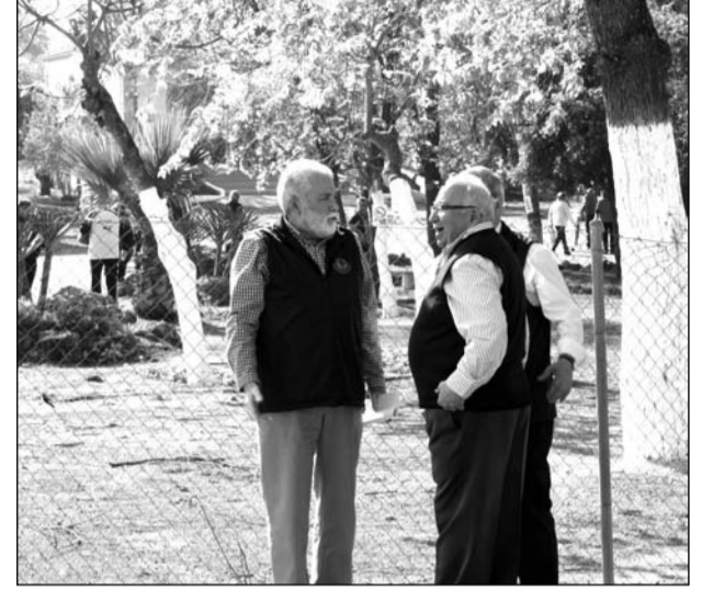
Los presidentes de ambas federaciones se saludan al llegar.