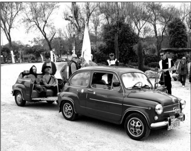
Vehículo de la Peña Los Amigos del 600 de Córdoba.