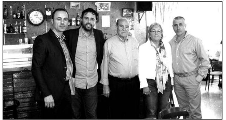
Invitados con el presidente Cristóbal Menacho en el centro de la imagen.

Los asistentes pudieron disfrutar de un menú en el que destacaba como plato principal el rabo de toro.