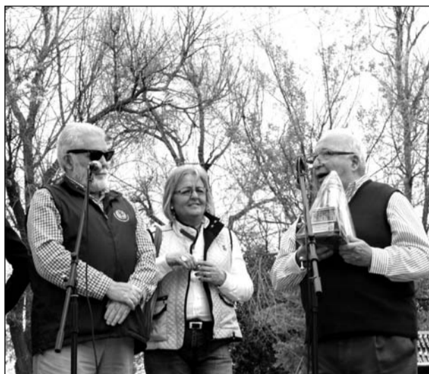
La Federación Malagueña obsequió con una Farola.