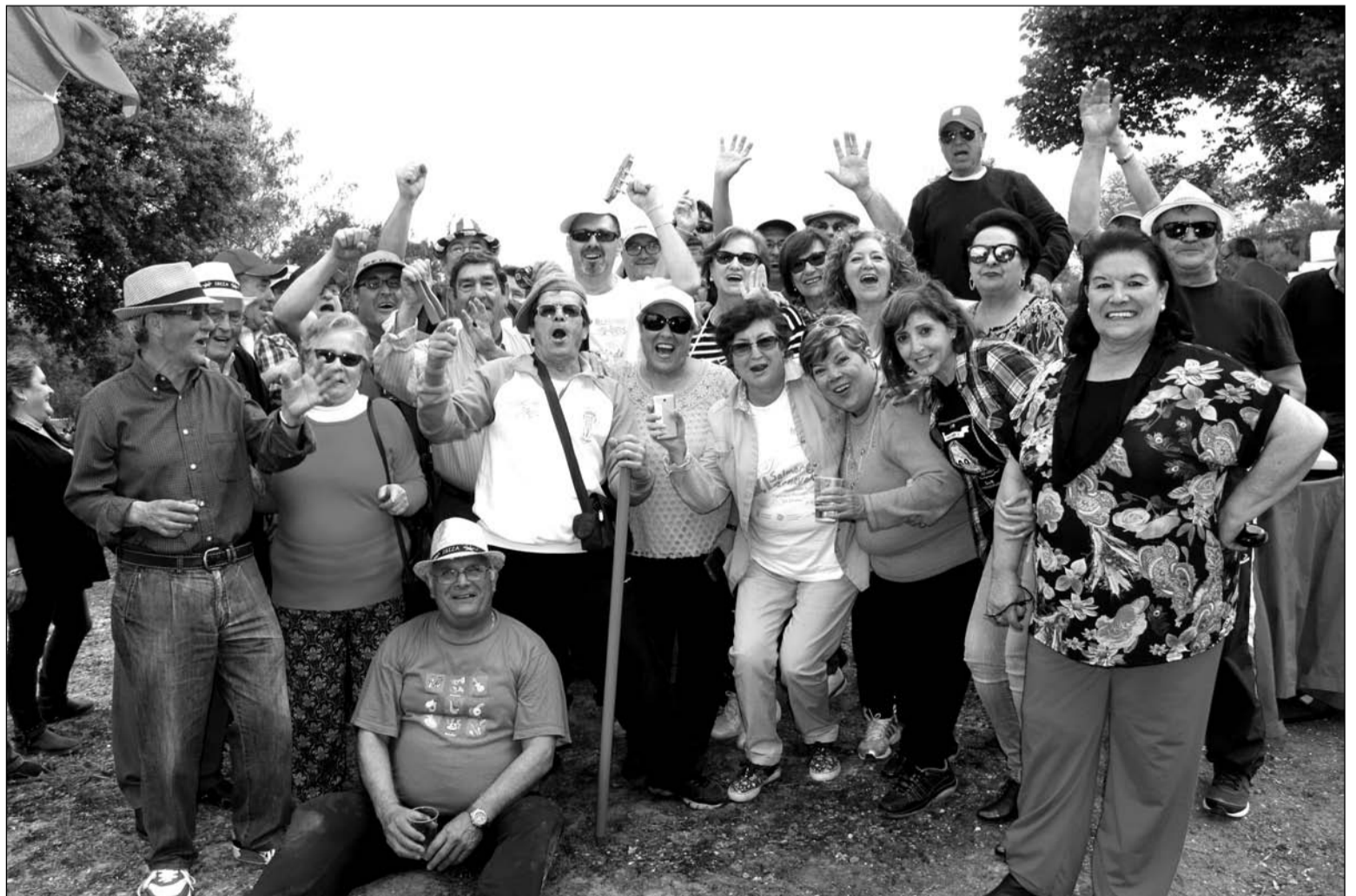
Peñistas disfrutando de la jornada de convivencia en el Parque Santillán de Mollina el pasado sábado 23 de abril.

Peña Cult. Flora El Arte de Nuestra Tierra Peña Amiga de las Matildes Peña Arte y Salero Peña Los Tenorios Peñas de las Peinas y Volantes Peña Los Canelas Club Campista Aire Libre Peña Las Ovejas Negras Peña Amigos de la Marcha Peña Fuente de la Salud Peña Caballista Los Troncos Peña Ritmo y Compás Casa de Aguilar de la Frontera Peña Amigos del 600 Amigos de Guadalcazar Peña Amigos del Baile de Salón Casa de Sevilla Peña Carnavalesca Los Castratis Peña Los de Santiago Peña Amigos Arroyo Pedroches