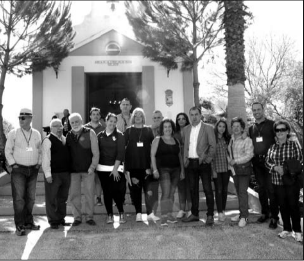
Componentes de la organización ante la ermita.