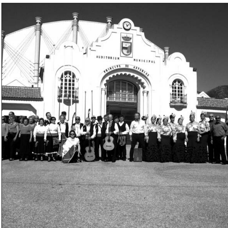
Grupos participantes ante el Auditorio Municipal de Torremolinos.