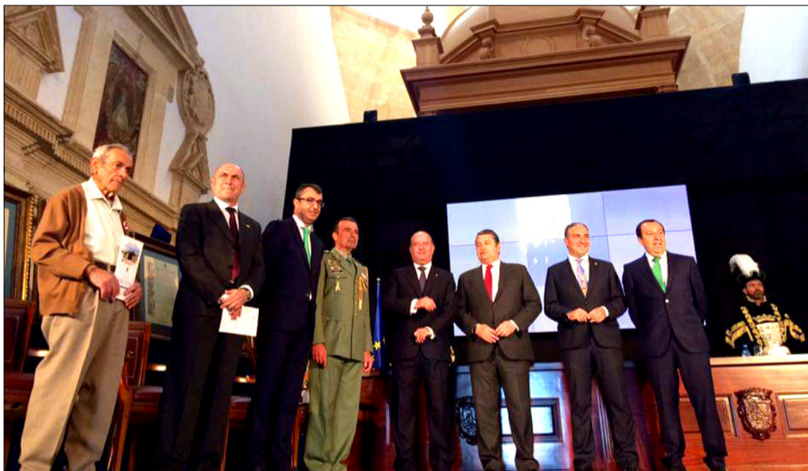
Los galardonados con las Medallas de la Provincia, junto a las autoridades presentes en el acto.