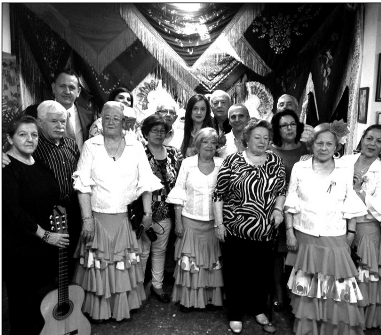
Invitados a la inauguración con directivos de la entidad y el coro.