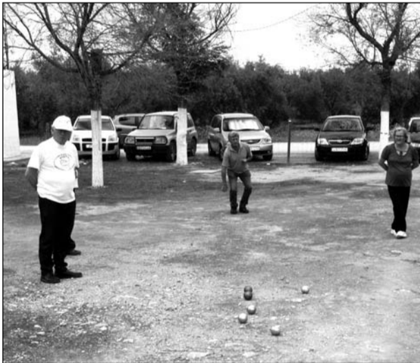
Torneo de Petanca organizado por el Club Teatinos.