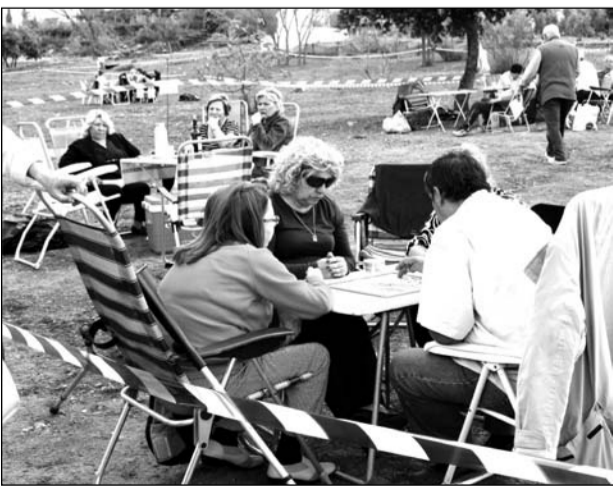
Peñistas aprovechan la jornada para jugar al parchís.