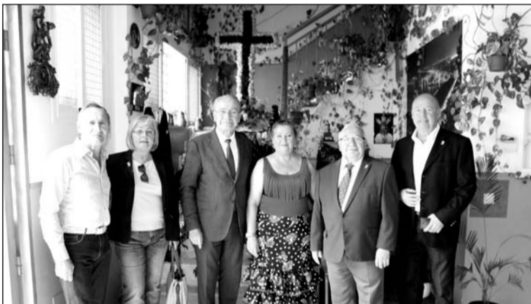
Autoridades y peñistas ante la Cruz de Mayo de la entidad.