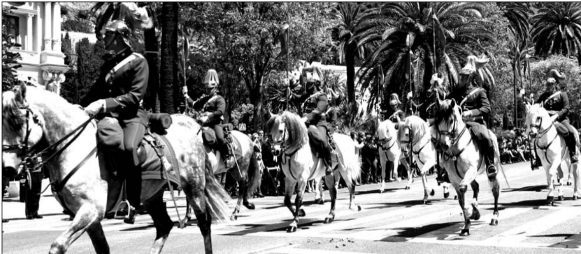
Unidades a caballo de la Guardia Real desfilan por el Paseo del Parque de Málaga.