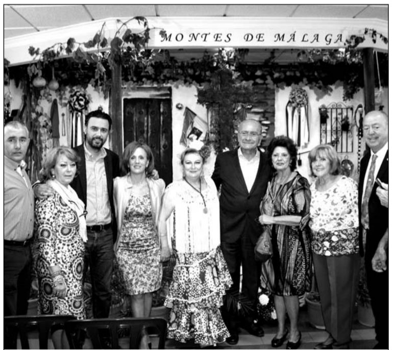
Asistentes a la inauguración.

No obstante, no era la única actividad programada para esta semana que estamos viviendo, ya que para el martes 3 de mayo, a las 15 horas, se anunciaba la celebración de una Olla Flamenca.