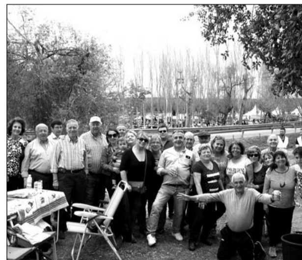
Buen ambiente entre las peñas en Mollina.