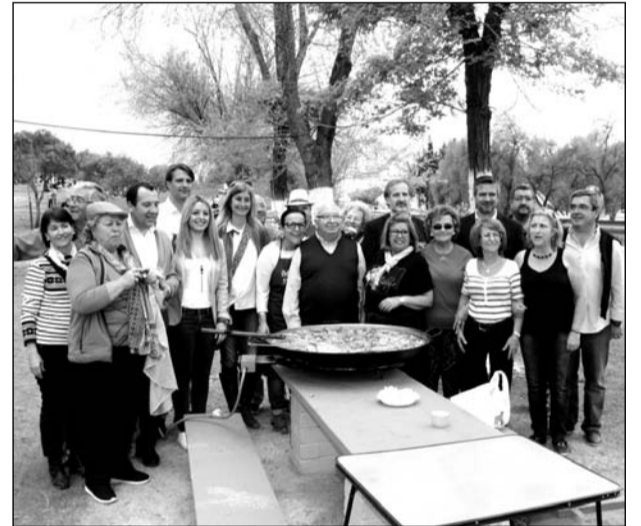
Preparativos de un arroz por parte de una entidad federada.