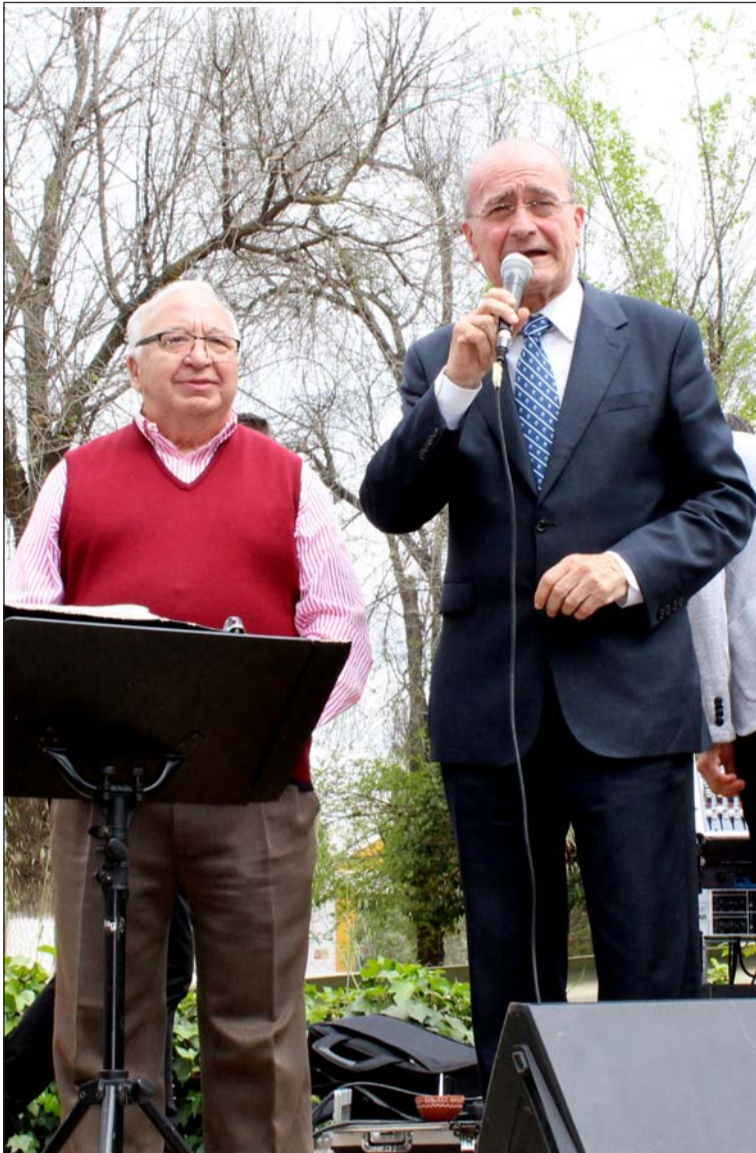
El alcalde de Málaga se dirige a los peñistas en el Parque Santillán.