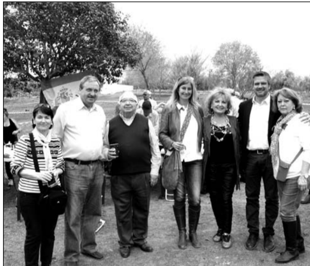
Instante de convicencia con socios de la Peña La Paz.