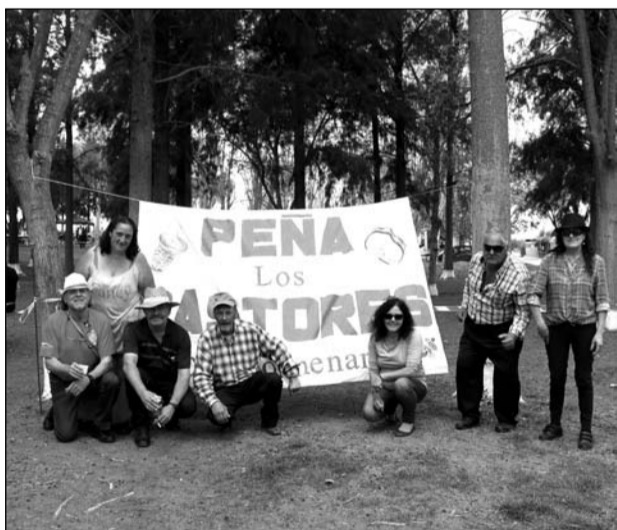
Socios de la Peña Los Pastores de Colmenarejo.