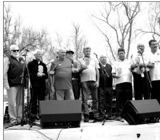
Entrega de trofeos del torneo de petanca.