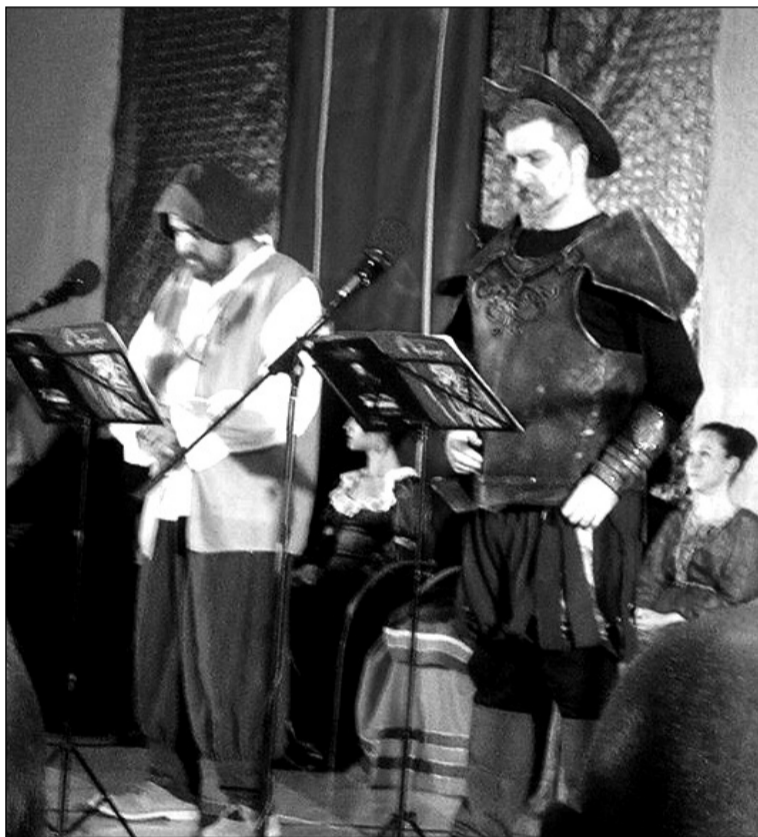
Un instante de la actividad cultural.

El propio Cervantes hizo de narrador, interpretándose escenas de algunas de sus obras como: 'El viejo celoso', 'La inglesa española' y como no, el sin par 'Don Quijote de la Mancha'. Terminando el acto con la muerte del Príncipe de los ingenios.