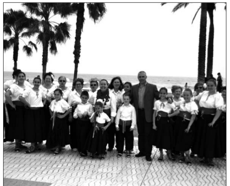
Participantes en esta actividad junto al mar.