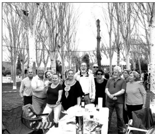
Peñistas malagueños disfrutando de la jornada campera.