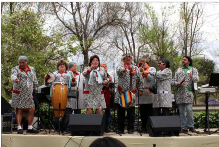
Actuación carnavalesca de Los Castratis de Córdoba.