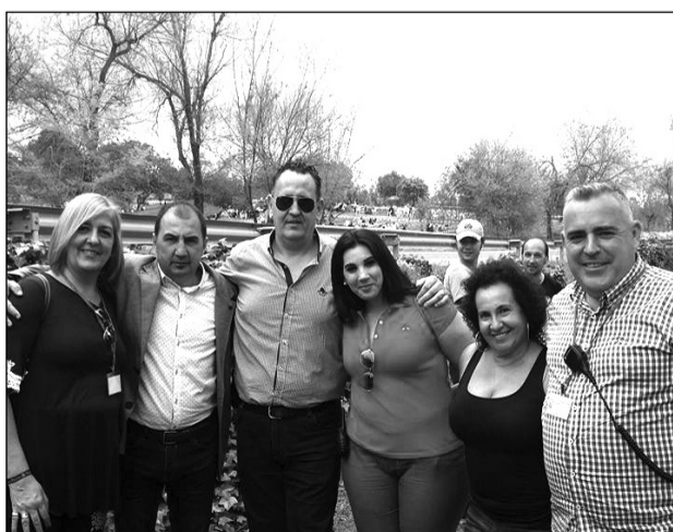
Componentes de la Federación Malagueña de Peñas.