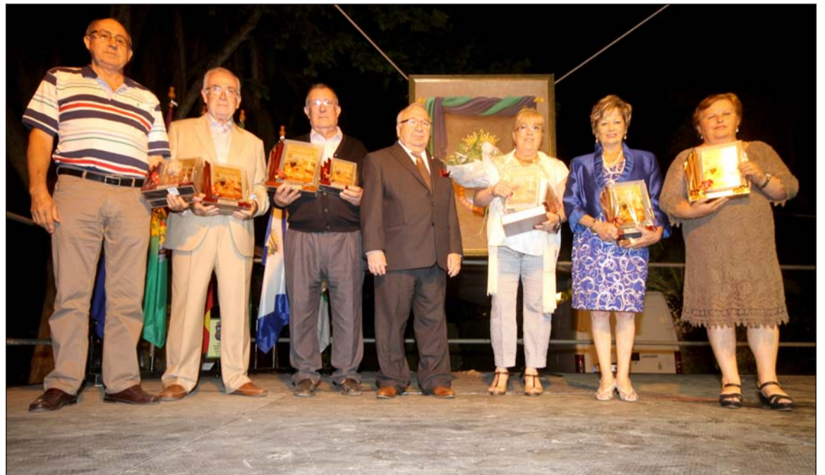
Entrega de premios en la edición del pasado año del Certamen de Cruces de Mayo.