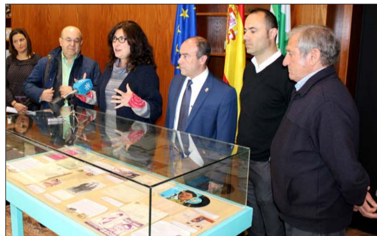
Un instante de la rueda de prensa de presentación.