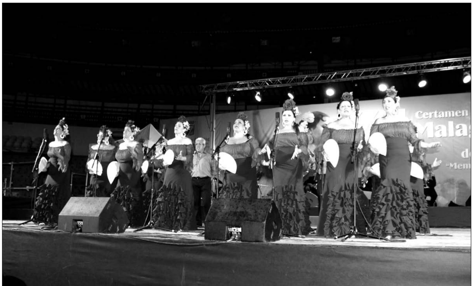
Uno de los coros que participaron en la edición anterior del Certamen de Malagueñas de Fiesta.