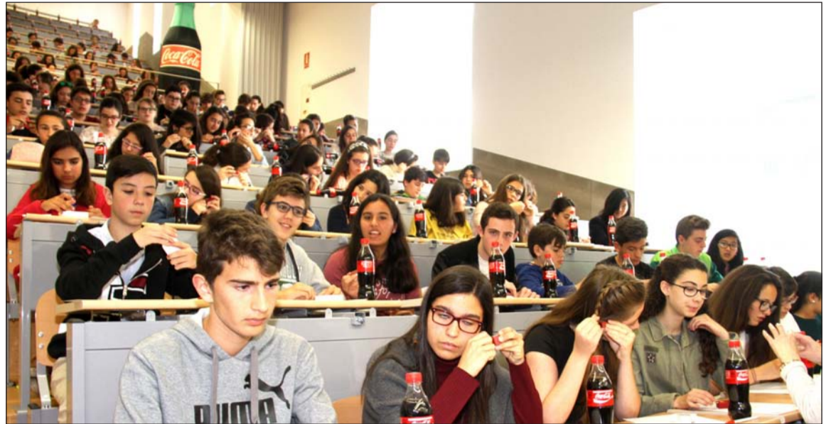
Alumnos preparados para iniciar la prueba en la Facultad de Comercio y Gestión.

Finalmente, el concurso concluirá con una Gala Nacional de entrega de premios que se celebrará en la sede de la RAE. En ella el jurado estatal, formado por prestigiosos periodistas y escritores, desvelará quiénes de entre los 17 finalistas autonómicos son los tres ganadores estatales, que serán galardonados con un curso a distancia de escritura creativa impartido por una prestigiosa escuela literaria.