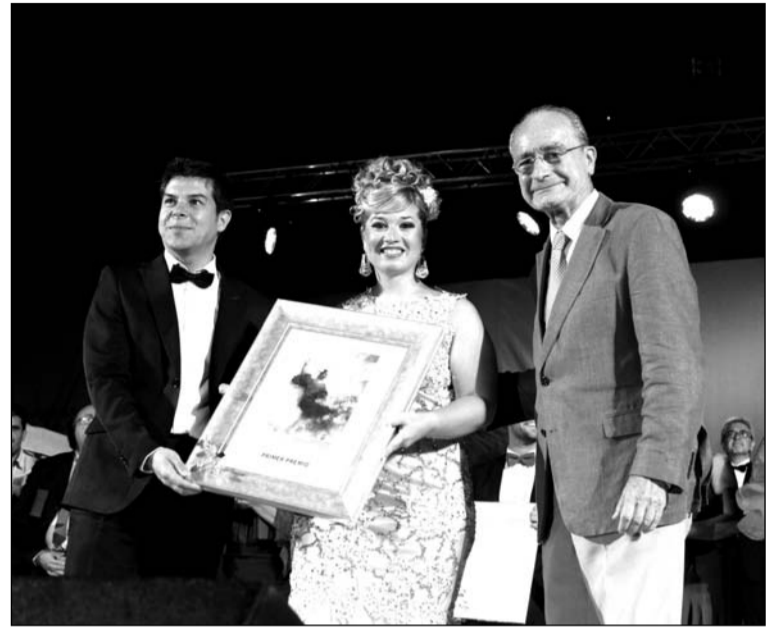
Entrega del primer premio de la edición de 2015.

Los candidatos para los premios de las malagueñas de fiesta deberán formalizar su solicitud antes del próximo día 6 de mayo, de 9 a 14 horas, en el Área de Servicios Operativos, Régimen Interior, Playas y Fiestas del Ayuntamiento de Málaga, situado en Camino de San Rafael número 99.