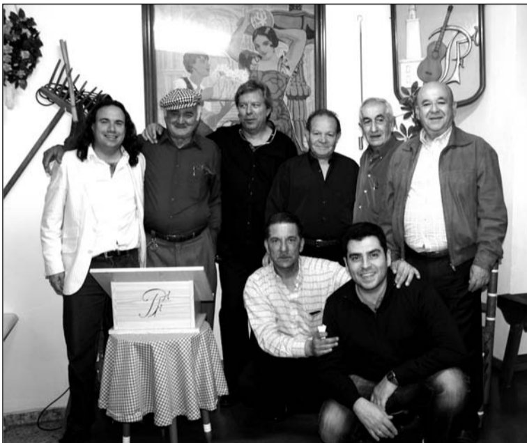
Artistas con peñistas e invitados a este acto.