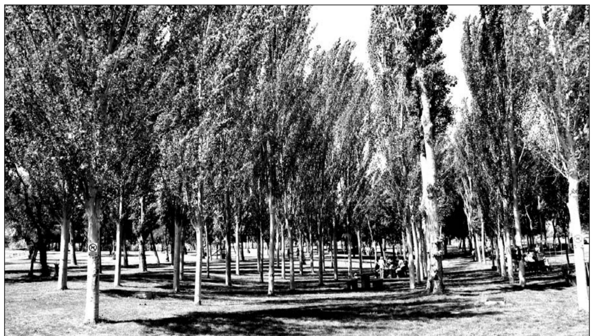
Vista de la arboleda del Parque Santillán.