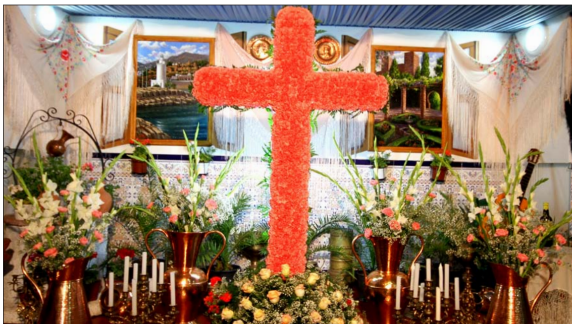
Montaje realizado el pasado año por la Peña Cruz de Mayo, que obtuvo el primer premio en el XXV Certamen.

La entrega de premios, por su parte, se efectuará el sábado día 21 de mayo a las 20:30 horas, en la Finca La Cónsula (Churriana), en un acto en el que también se pronunciará el tradicional pregón de exaltación a esta fiesta.