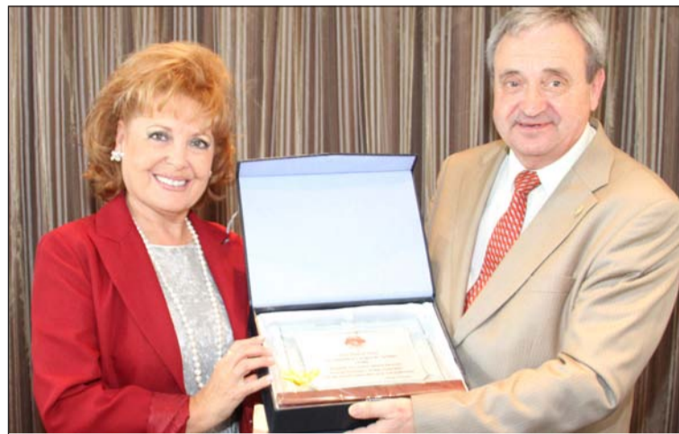
La presidenta de la Peña La Paz hace entrega de un recuerdo.