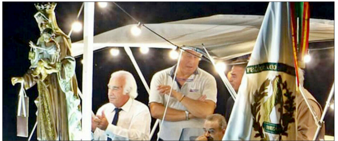
La Virgen del Carmen, embarcada en el río Guadalquivir el pasado mes de julio de 2015.

Fue entonces cuando se planteó la recuperación de estos grandes encuentros entre peñistas de ambas provincias, para lo que se creaba una comisión abierta a todos los peñistas interesados en participar en ella, y en la que han participado activamente algunas de las personas que vivieron en primera persona aquellos encuentros de la década de los noventa, y otros que están deseosos de compartir experiencias con otros peñistas.