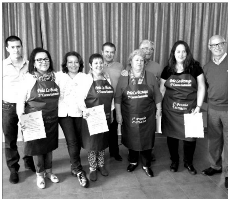
Entrega de premios del V Concurso Gastronómico.