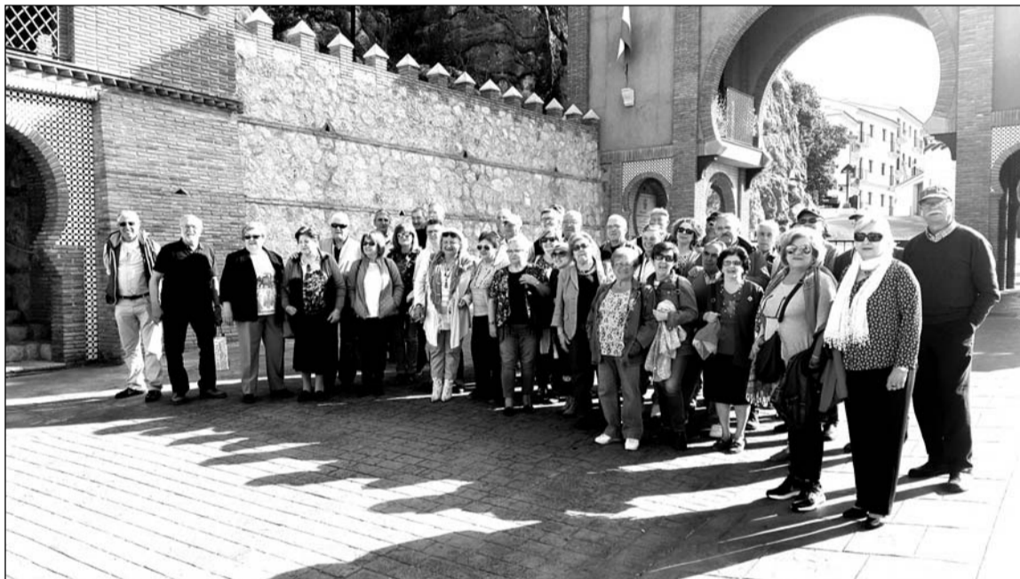
Socios de la Agrupación Cultural Telefónica en la entrada al municipio de Comares.

Como antesala al almuerzo, no podía faltar la cata de varios de sus exquisitos caldos, extraídos de sus peculiares viñedos y tras el citado almuerzo, de vuelta a Málaga con la sensación de haber disfrutado de una gran jornada.