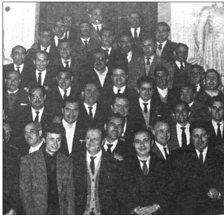
Primera reunión de presidentes en el Ayuntamiento en marzo de 1964.

Es digno de destacar que la Federación de Peñas Cordobesas en sus largos años de existencia realizaron muchas actividades, como fomentar las Romerías de Santo Domingo y