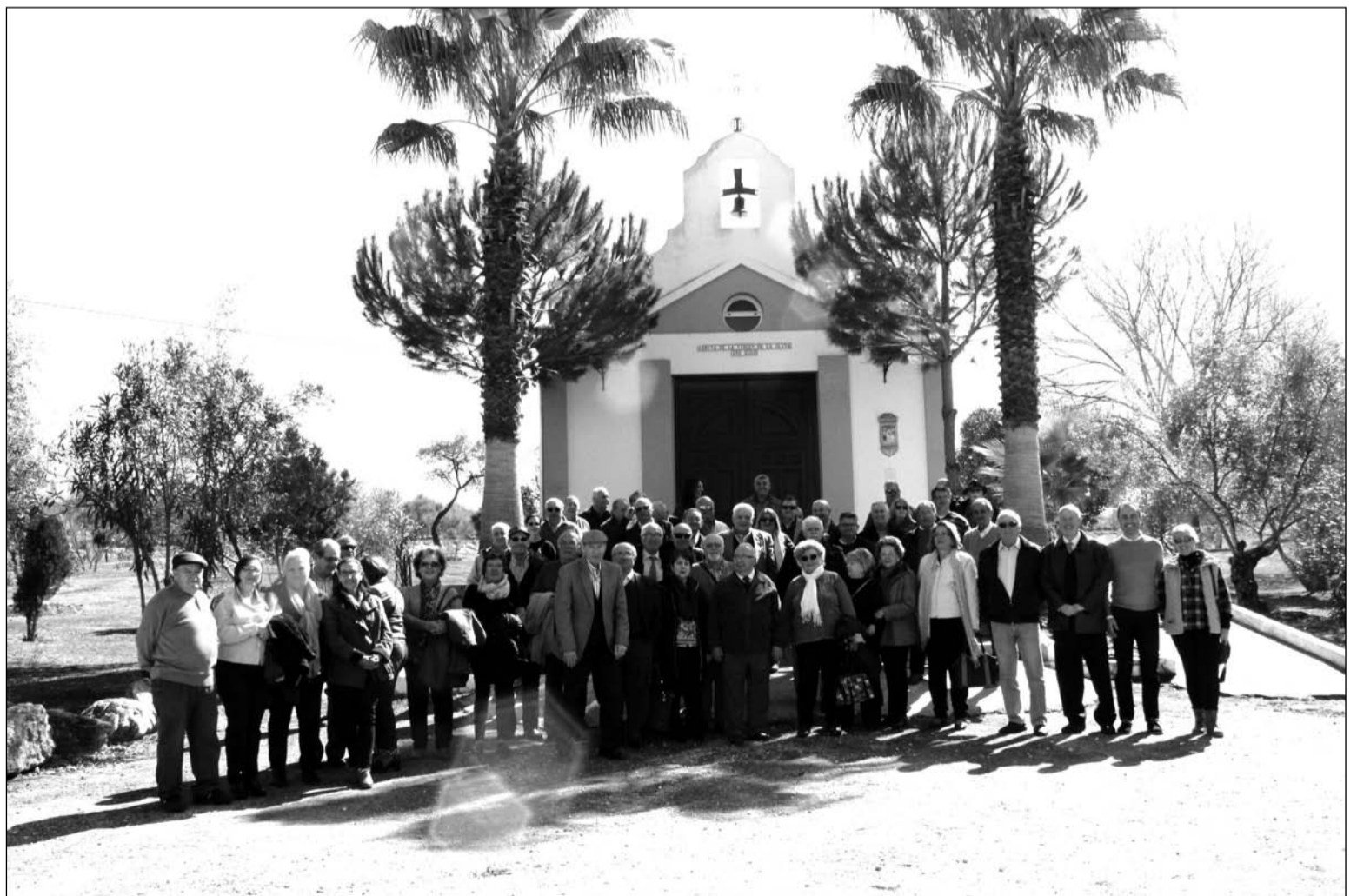
Componentes de diferentes entidades federadas malagueñas visitando el Parque Santillán durante la excursión que el pasado mes realizaron a Molina.

Peña Cult. Floral El Arte de Nuestra Tierra Peña Amiga de las Matildes Peña Arte y Salero Peña Los Tenorios Peñas de las Peinas y Volantes Peña Los Canelas Club Campista Aire Libre Peña Las Ovejas Negras Peña Amigos de la Marcha Peña Fuente de la Salud Peña Caballista Los Troncos Peña Ritmo y Compás Casa de Aguilar de la Frontera Peña Amigos del 600 Amigos de Guadalcazar Peña Amigos del Baile de Salón Casa de Sevilla Peña Carnavalesca Los Castratis Peña Los de Santiago Peña Amigos Arroyo Pedroches