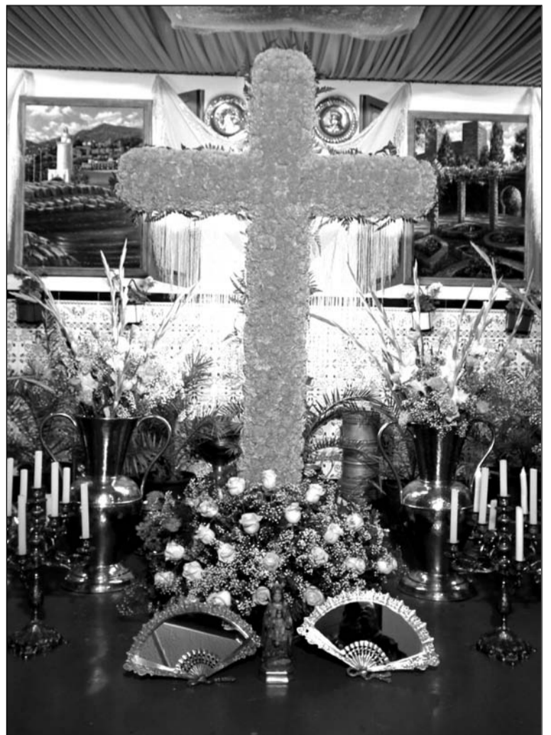
Cruz de la Peña Cruz de Mayo, primer premio en 2015.