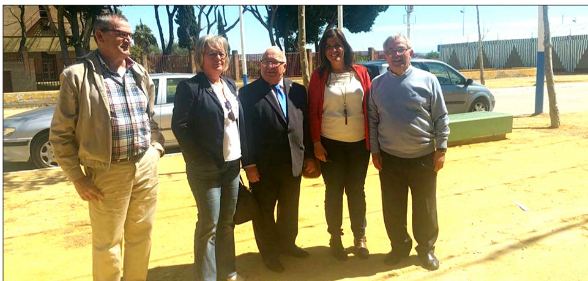
Visita de representantes del Ayuntamiento de Málaga y la Federación de Peñas al recinto ferial de El Puerto de Santa María.