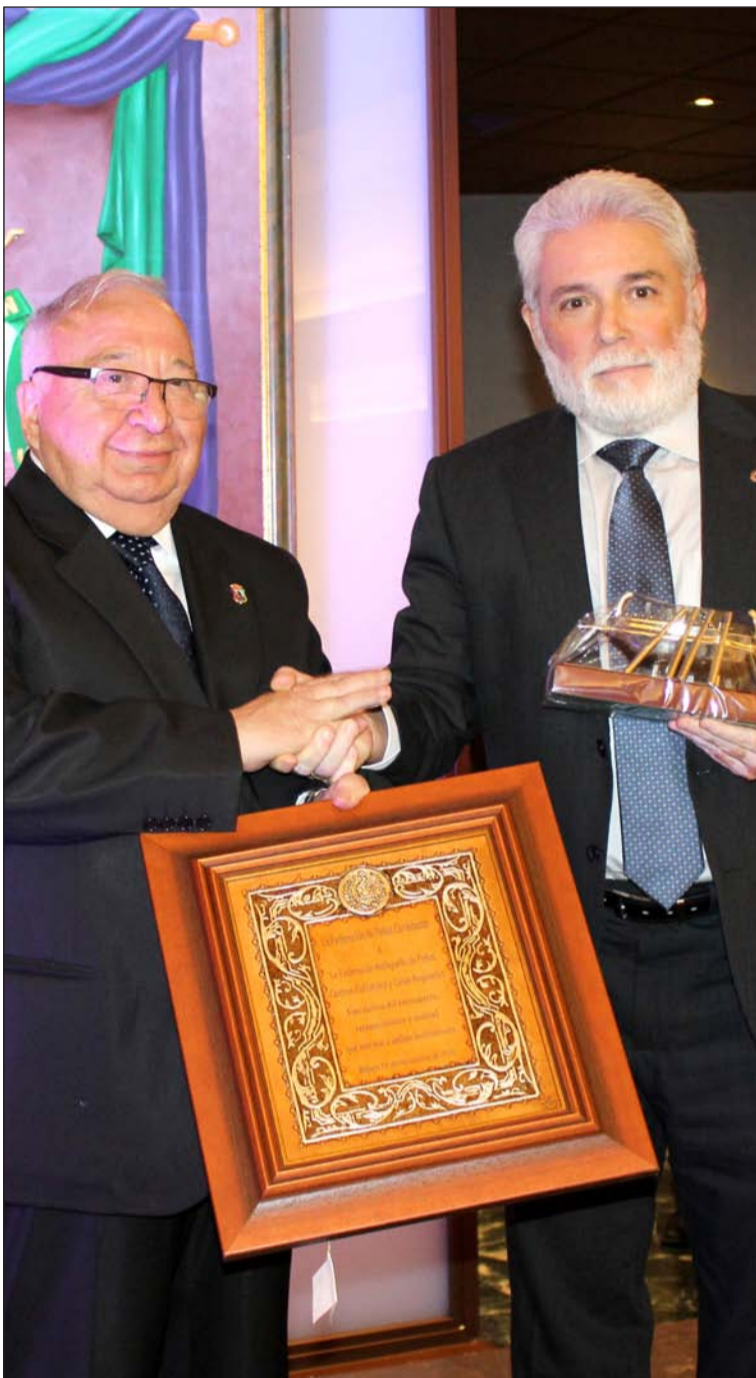
Intercambio de recuerdos en el Aniversario de la Federación Malagueña.

esta federación cordobesa en el año 2014.