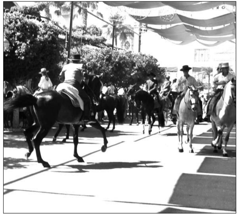
Paseo de caballos por el recinto de Cortijo de Torres.

vicio de Aperturas del Área de Comercio y Vía Pública, durante las dos semanas anteriores al inicio de la Feria, la autorización expedida así como la documentación exigida; debiendo encontrarse ambas en la caseta a disposición de la autoridad municipal a efectos oportunos, acompañada de un certificado de la dirección técnica de las