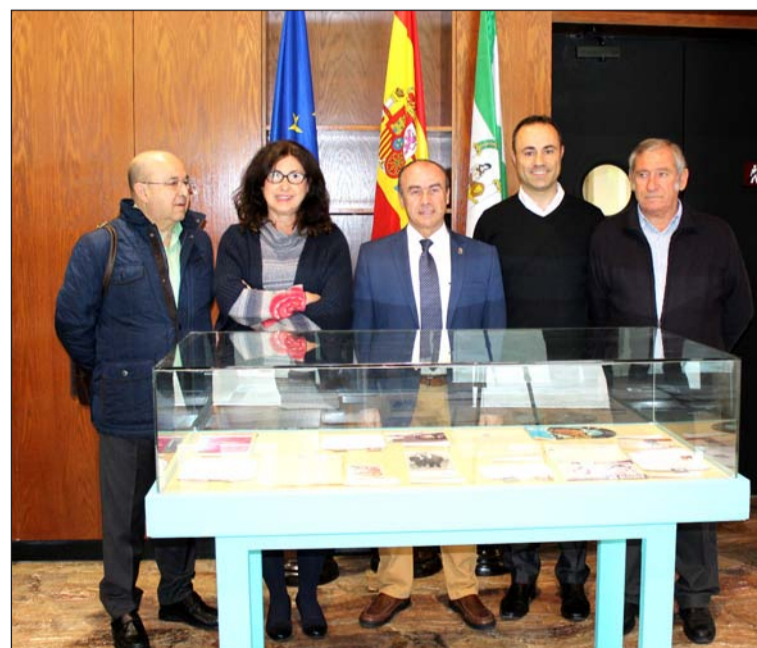
La Federación de Peñas fue invitada a participar en el acto.