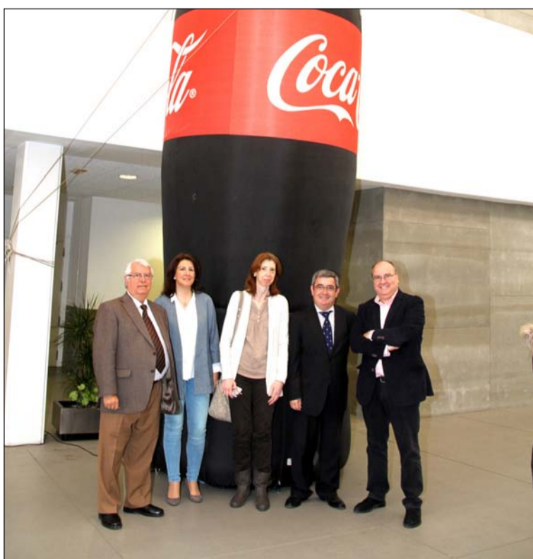
Responsables de la organización y colaboradores.

Diseño y Fabricación de Puertas, Armarios y Parquet