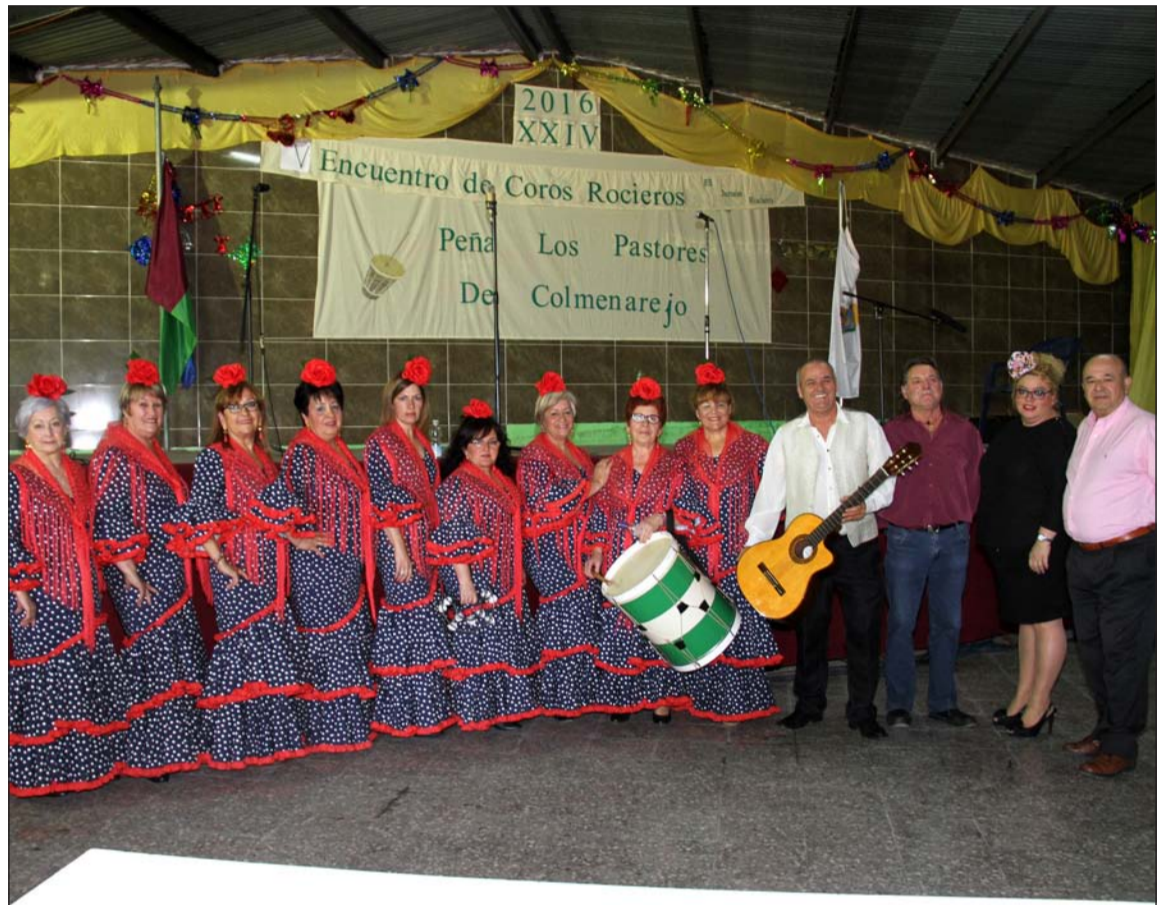
Uno de los coros, con el presidente de la entidad, la presidenta de Huertecilla Mañas y el vicepresidente de la Federación.