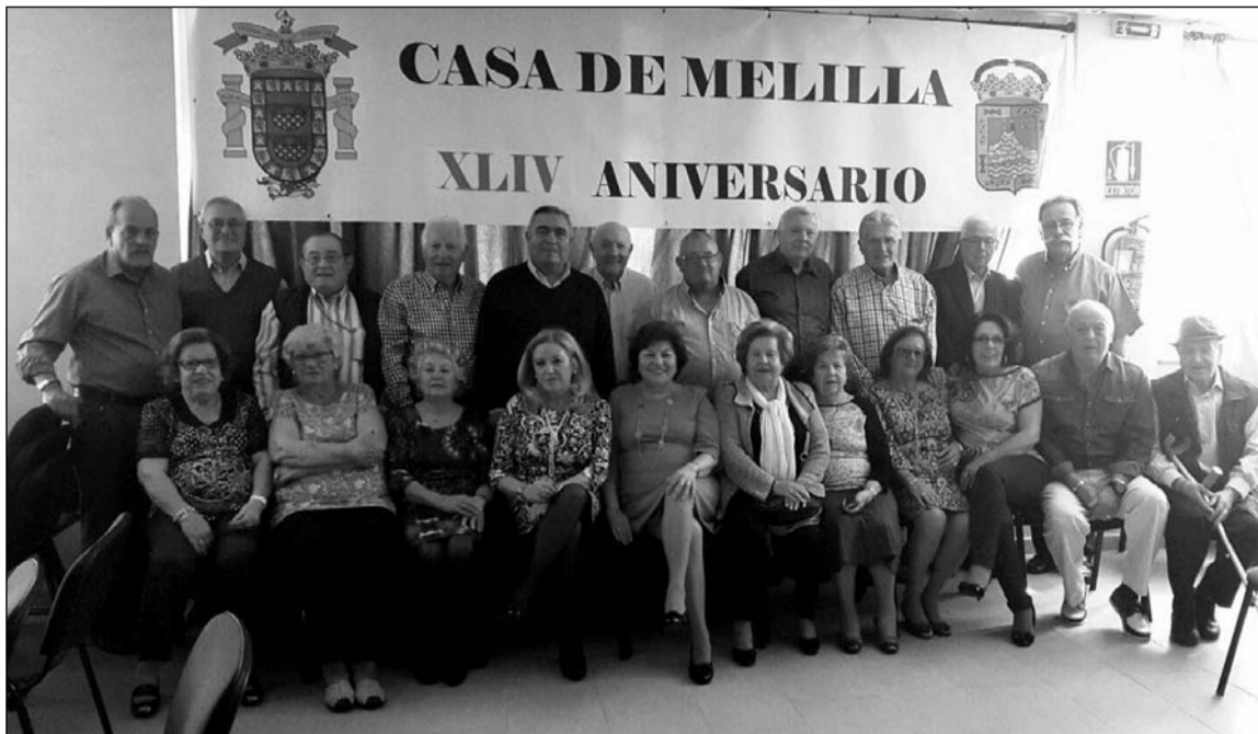
Socios encargados de organizar los actos del aniversario.