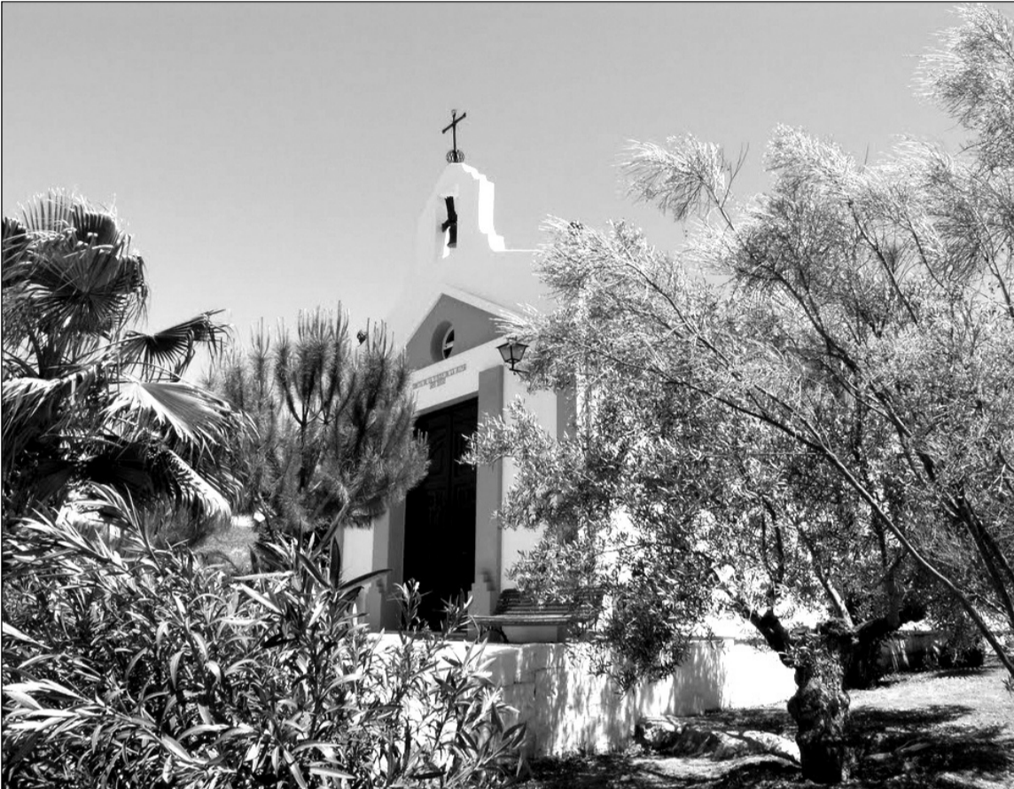
Ermita de la Virgen de la Oliva, patrona de Molina, en el Parque Santillán.