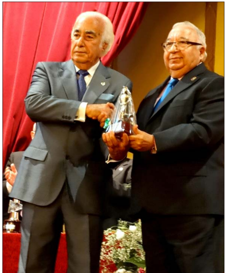
Acto de entrega de Potros en el año 2014, cuando se retomaron las relaciones.

de elogios y alabanza por las autoridades y federativos, intercambiándose regalos. Terminó la confraternización con una comida en el hotel Málaga Palacio.