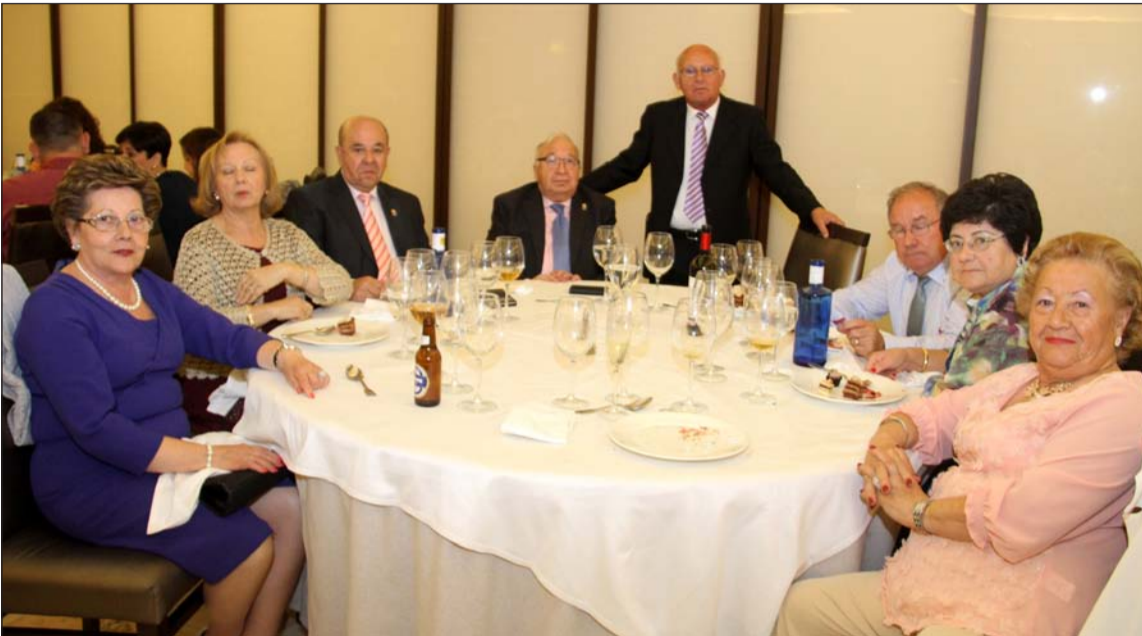
El homenajeado, de pie, junto a los componentes de la mesa presidencial.