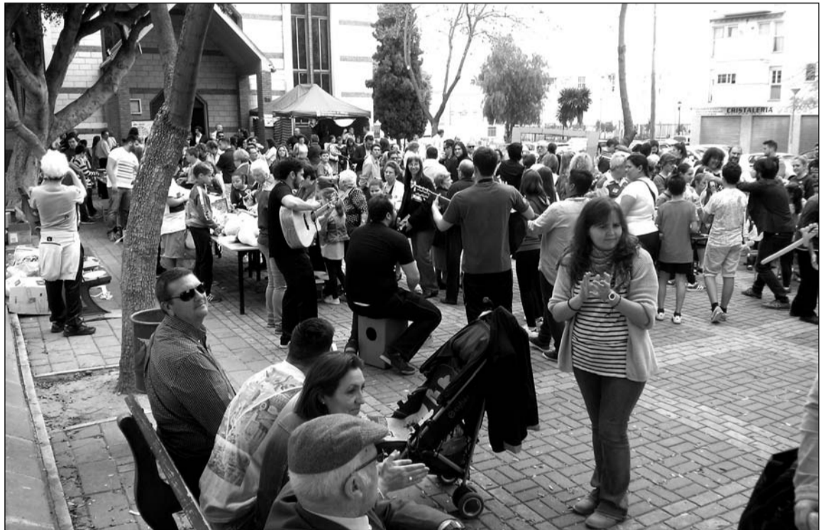
Ambiente junto a la iglesia de la Virgen del Camino para colaborar con Manos Unidas.

Desde la Asociación de Vecinos Zona Europa, una entidad integrada en la Federación Malagueña de Peñas, Centros Culturales y Casas Regionales 'La Alcazaba', ya se está preparando otro evento para el 2 de mayo, donde habrá diversas actuaciones.