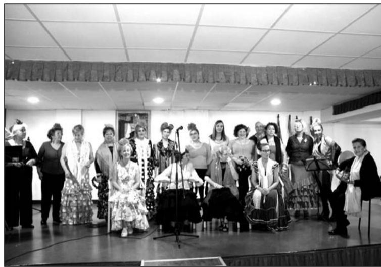
Uno de los coros participantes en esta actividad benéfica.

Además, en el programa de este mes se incluyen actividades habituales como los tradicionales almuerzos de socios de los miércoles, clases de bailes, guitarra o talleres de pintura, entre otros. Además, todos los domingos se ofrece un menú económico para todos los socios de esta entidad perteneciente a la Federación Malagueña de Peñas, Centros Culturales y Casas Regionales 'La Alcazaba'.