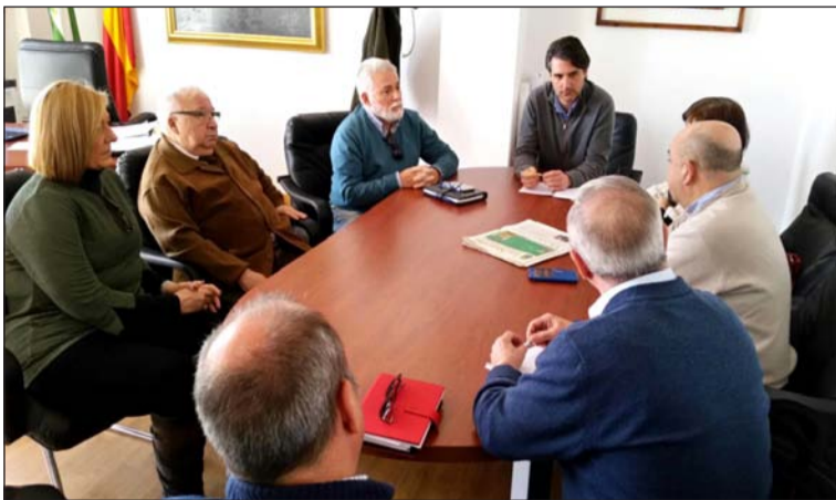
Reunión con las autoridades de Mollina.