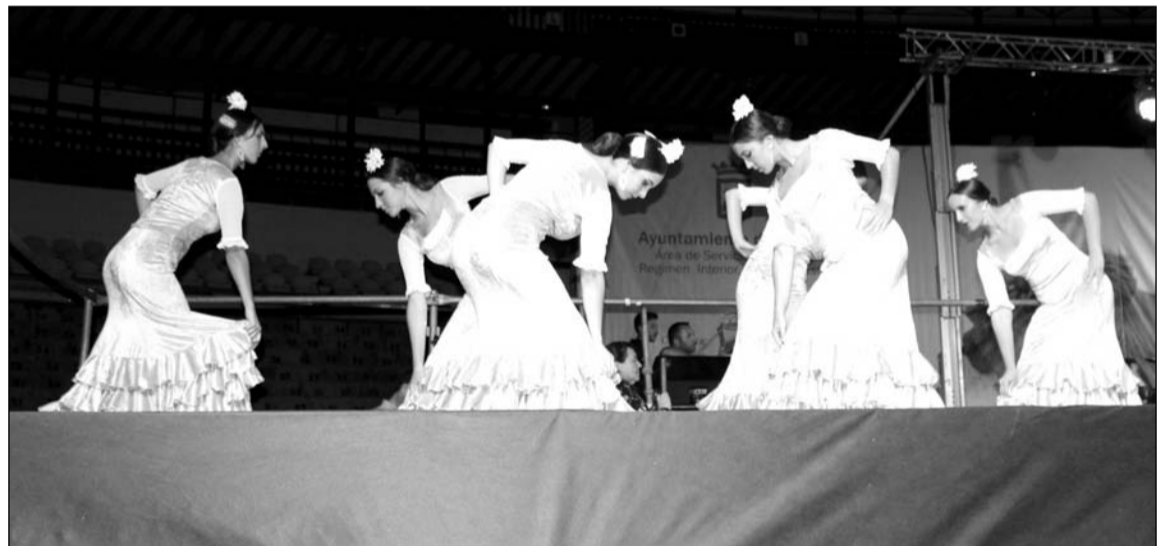
Un grupo de baile sobre el escenario de la plaza de toros de La Malagueta.