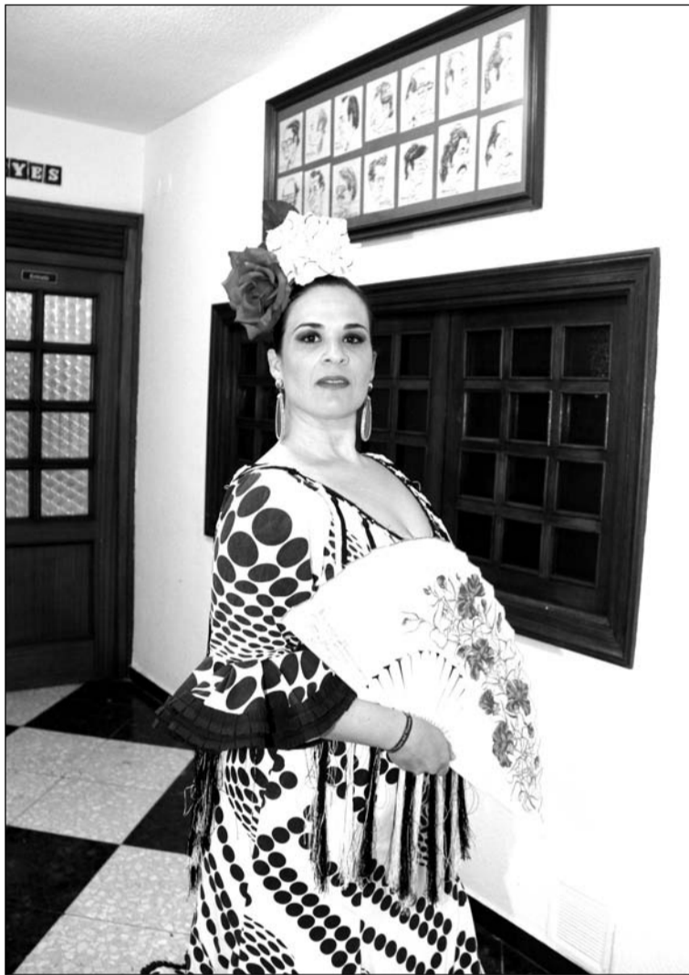
La cantante Macarena, dispuesta a actuar en la Fiesta de la Primavera.