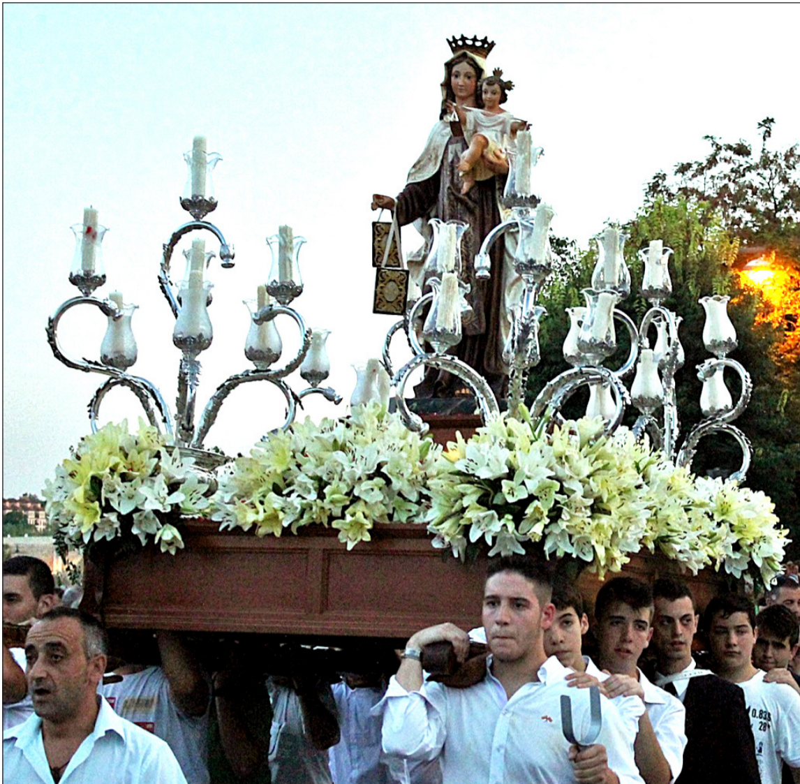
Virgen del Carmen que fue ofrecida por los peñistas malagueños a sus hermanos de Córdoba en los años 90.

◆ Federación Malagueña de Peñas, Centros Culturales y Casas Regionales 'La Alcazaba'