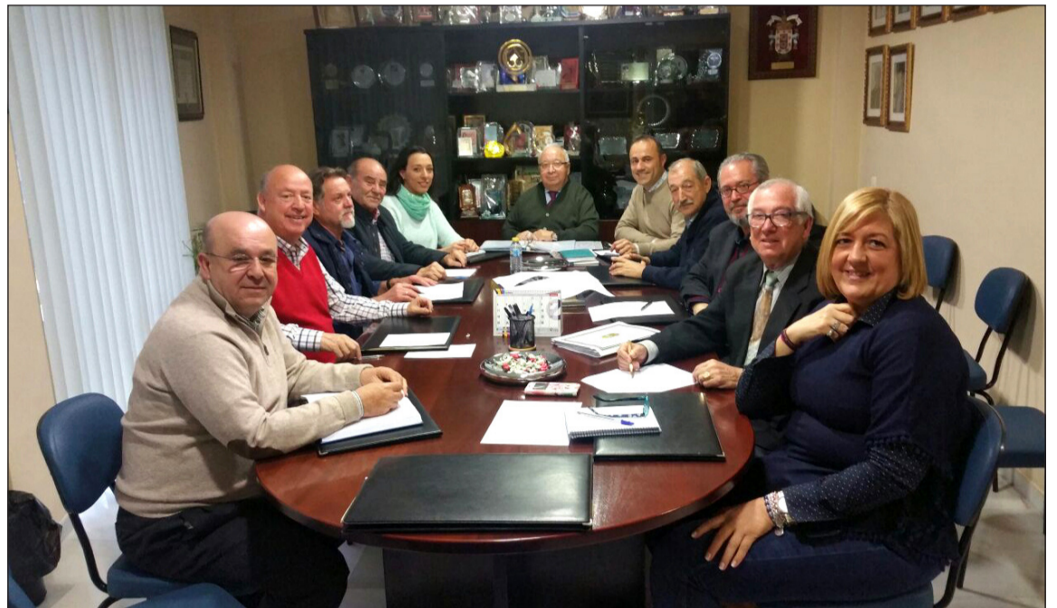
Comisión creada para la organización de este evento, reunida el pasado lunes 4 de abril en la sede de la Federación.

Además, existirán escenarios en los que se sucederán las actuaciones. Así, diversas entidades han ofrecido sus coros, grupos de baile o cualquier otro tipo de actuación