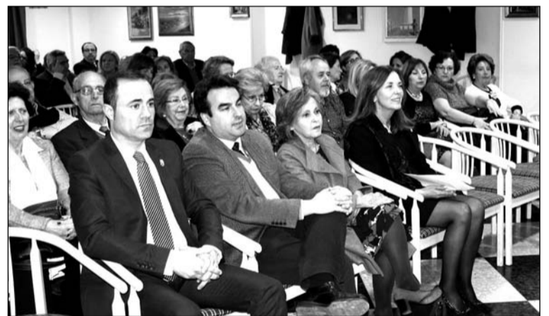
Asistentes a la Exaltación de la Peña El Sombrero.

Numerosas socias optaron por acudir ataviadas con la clásica mantilla española, en un acto en el que también estuvo presente otro elemento destacado de nuestra Semana Santa como es la saeta.