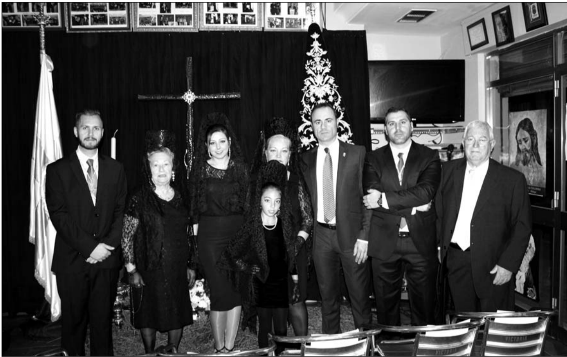
Participantes en la Exaltación de la Mantilla de la Peña Palestina.