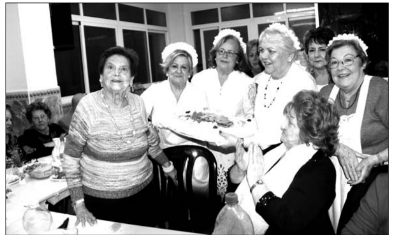
Tarta para celebrar el cumpleaños de una de las mayores.