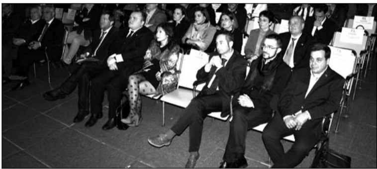
Asistentes al pregón en el salón de actos del colegio Salesiano.

La exaltación no ha sido la única actividad cofrade programada por esta asociación vecinal durante esta cuaresma, ya que al día siguiente por la tarde colaboraba en la salida procesional de Nuestra Señora del Sol por el barrio de la Victoria, así como el 19 de marzo con la procesión infantil de Nuestro Padre Jesús de Capuchinos y María Santísima de la Fuente Victoriana.