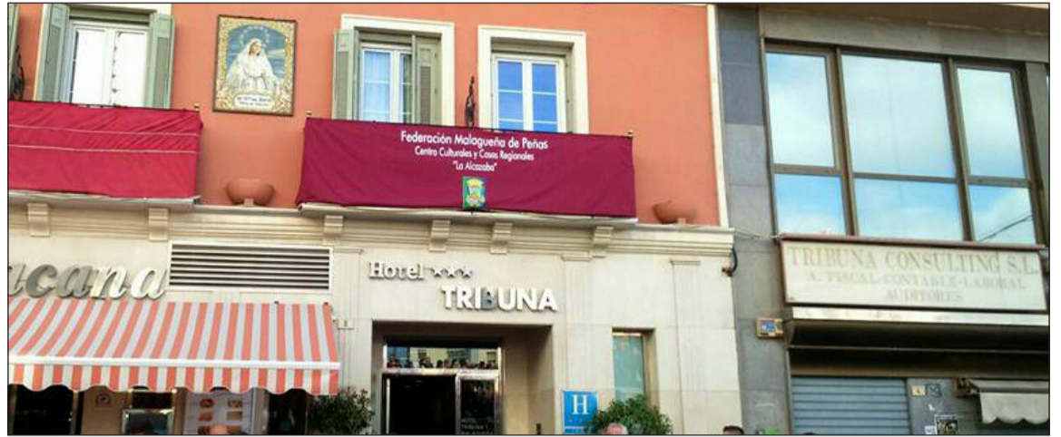
Balcón desde el que la Federación de Peñas ofrece sus saetas a las procesiones en el Hotel Tribuna Malagueña.

Junto al Rocío, también hace su paso por esta céntrica calle otras hermandades victorianas como la Humildad (que lamentablemente tuvo que suspender su salida por la lluvia del pasado Domingo de Ramos), el Rescate, el Monte Calvario y el Amor; estando prevista la realización de algunas petaladas desde estos balcones.