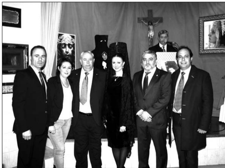
Asistentes al acto de Exaltación de la Semana Santa.