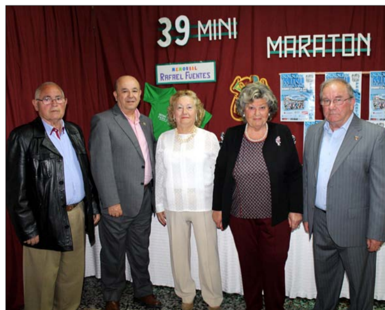
Algunos de los asistentes al acto de entrega de trofeos.