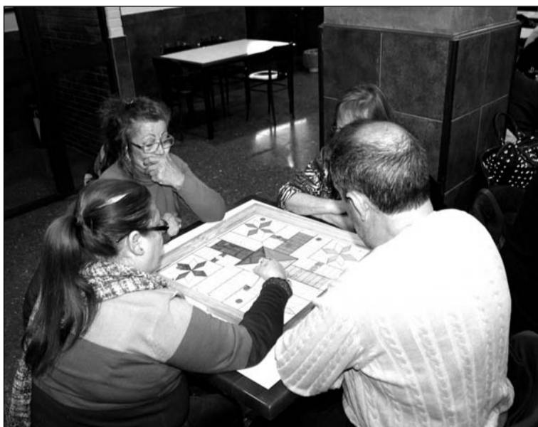
Una de las partidas.