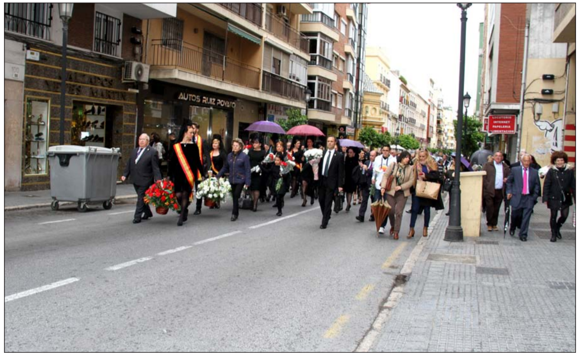
Comitiva peñista por calle Victoria, a pesar de la lluvia que caía en esos instantes.