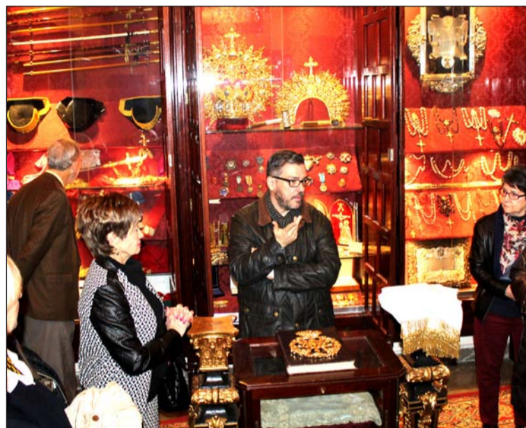
Visita guiada al Museo de la Expiración.