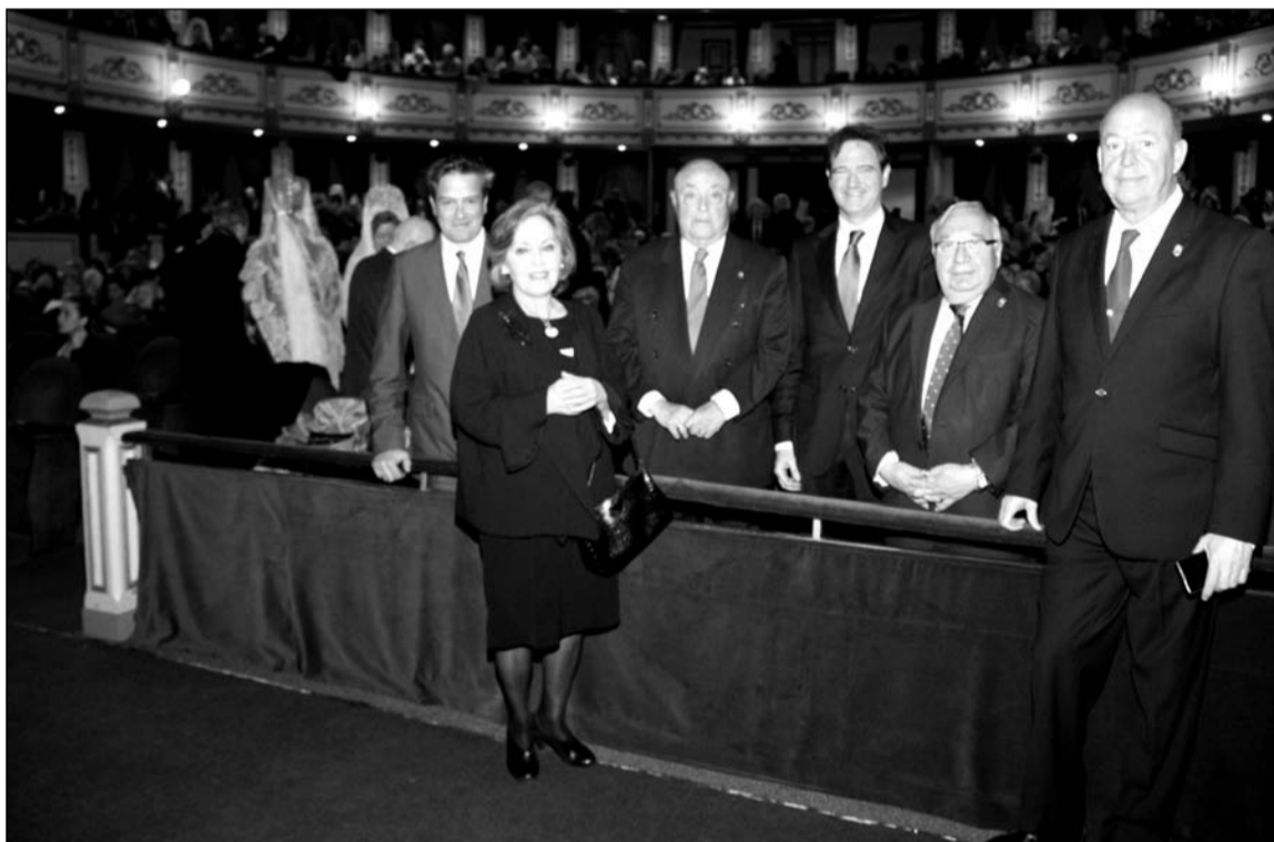
Invitados al acto celebrado en el Teatro Cervantes de nuestra capital