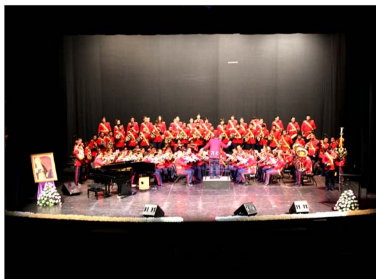
Banda de Cornetas y Tambores de la Caridad de Vélez Málaga.

Hay cosas que son exclusivamente malagueñas