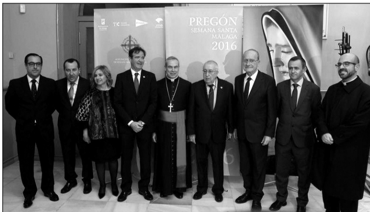
Algunas de las autoridades asistentes al Pregón.

La Federación Malagueña de Peñas, Centros Culturales y Casas Regionales 'La Alcazaba' fue invitada por la Agrupación de Cofradías de Semana Santa a participar en este acto tan emblemático para nuestra capital.