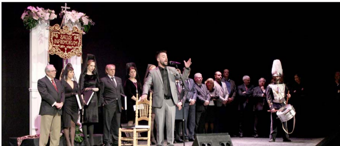
El ganador del concurso, actúa para cerrar el acto en presencia de los restantes finalistas y los encargados de entregar premios.