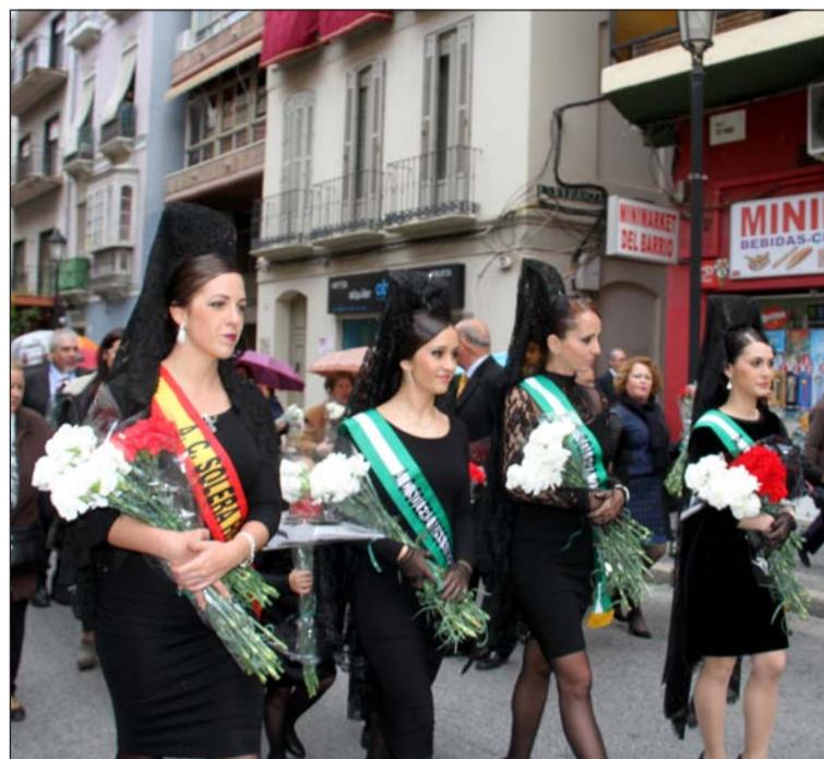
Reinas de diferentes entidades participan en la Ofrenda Floral.