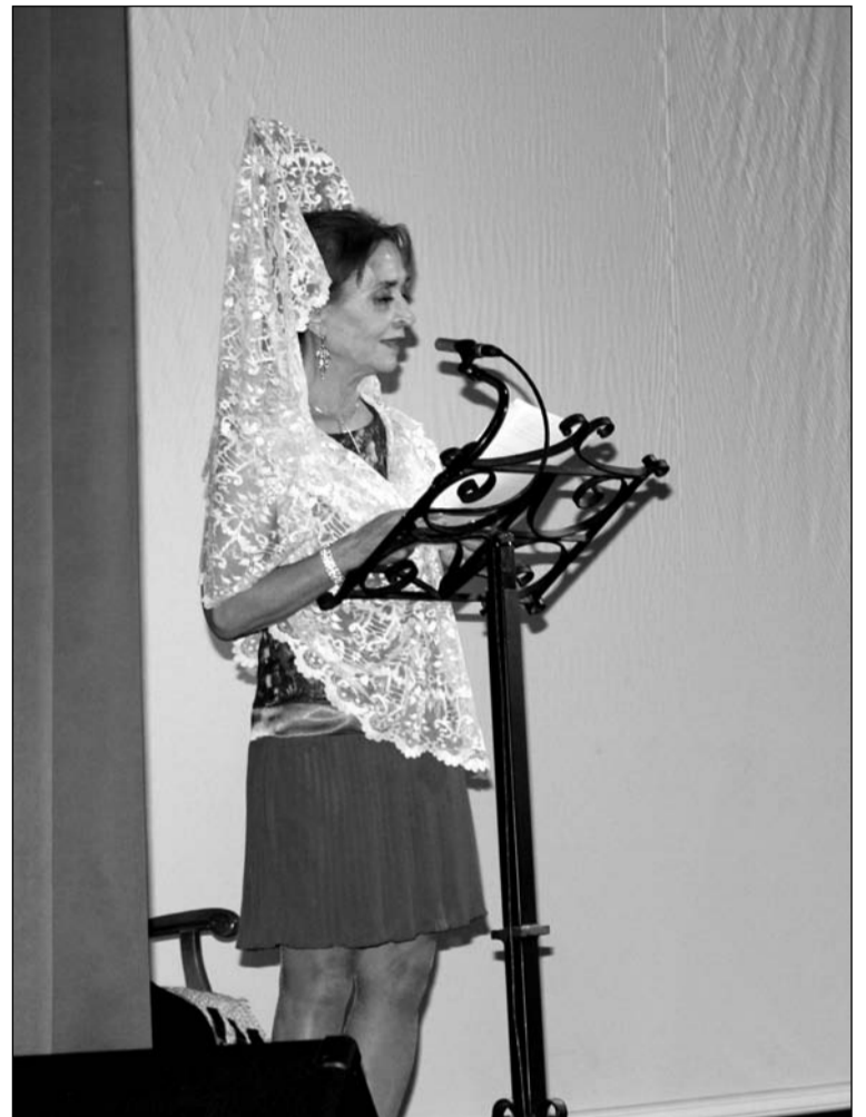
La pregonera, en un instante de su intervención.