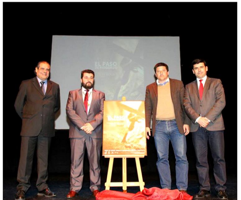
Presentación del cartel de estas representaciones.

respaldo en las instituciones públicas, así la Diputación Provincial en 2004; un reconocimiento que suma a una larga lista de premios, entre los que se incluye la Medalla de Oro de la provincia (2014) o el reconocimiento como Fiesta de Interés Turístico Nacional (1996), entre otros.