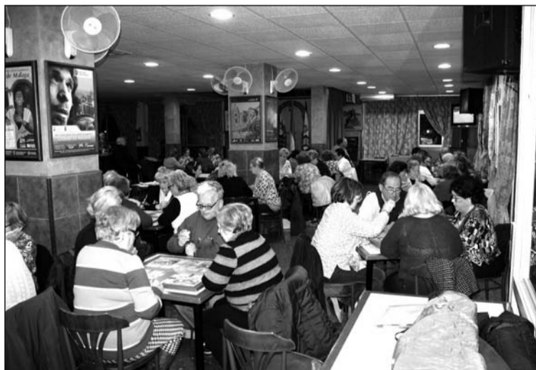
Imagen del campeonato celebrado en la sede de la Peña Ciudad Puerta Blanca.

perteneciente a la Federación Malagueña de Peñas, Centros Culturales y Casas Regionales 'La Alcazaba' como es la Peña Ciudad Puerta Blanca, que le cedió su sede para desarrollar esta actividad.