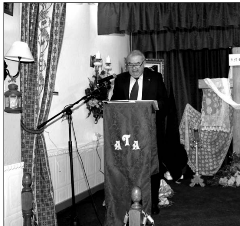
Un instante del pregón pronunciado en la sede de la Asociación.