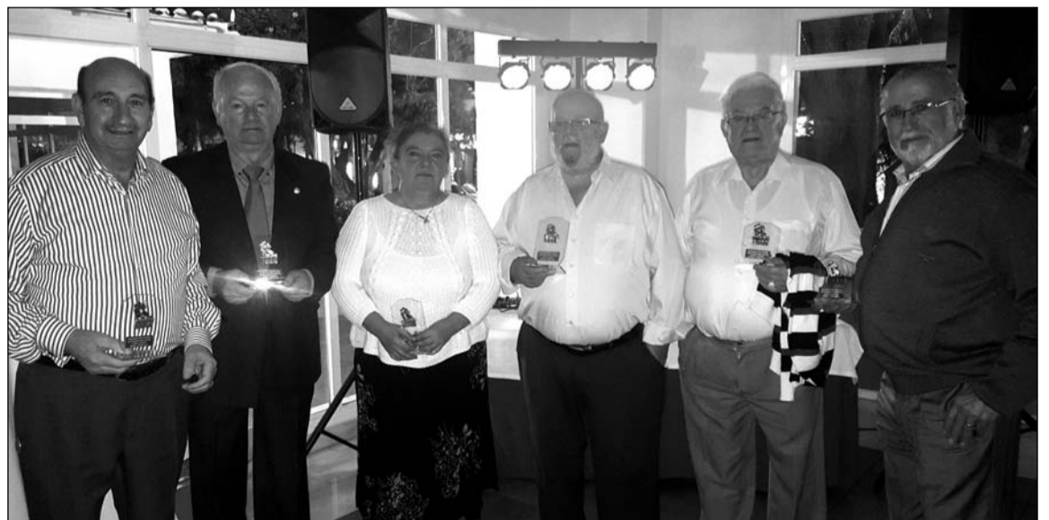
Entrega de trofeos a los ganadores en el torneo de dominó disputado durante el fin de semana.

fiestas, tras la entrega de trofeos del torneo de dominó, un DJ se ocupó de que el personal se moviera al ritmo que él marcaba