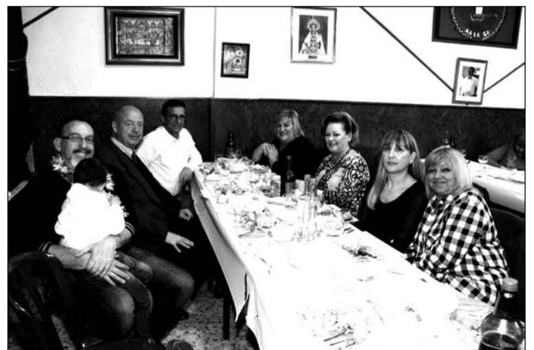
Comida con motivo del Día del Padre.