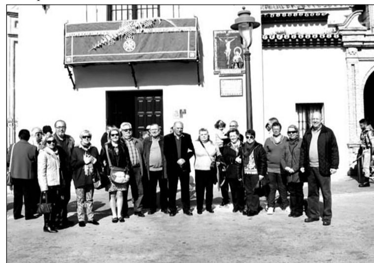
Grupo de socios de entidades federadas en el exterior de Santo Domingo.