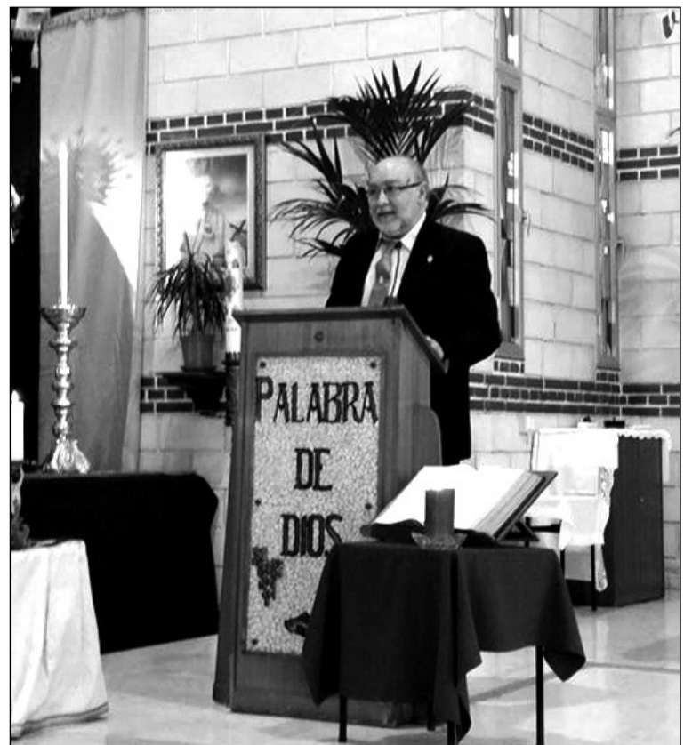
Acto cofrade celebrado en la iglesia de la Virgen del Camino.