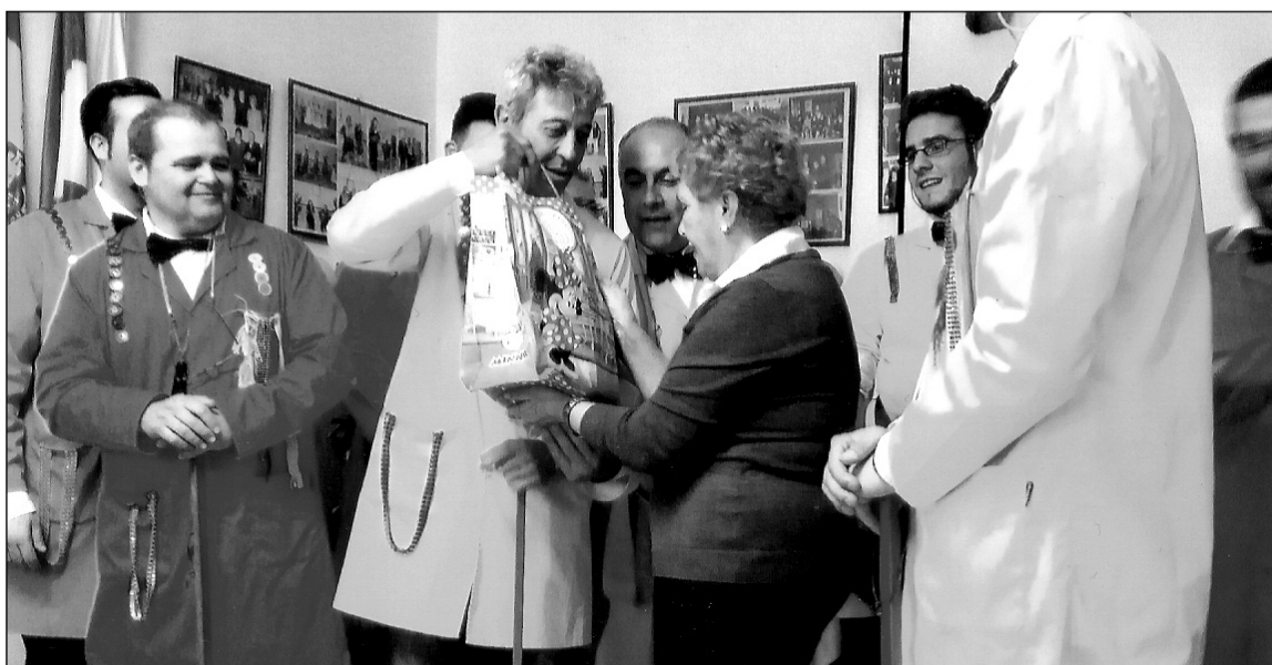
La presidenta, con una de las agrupaciones participantes