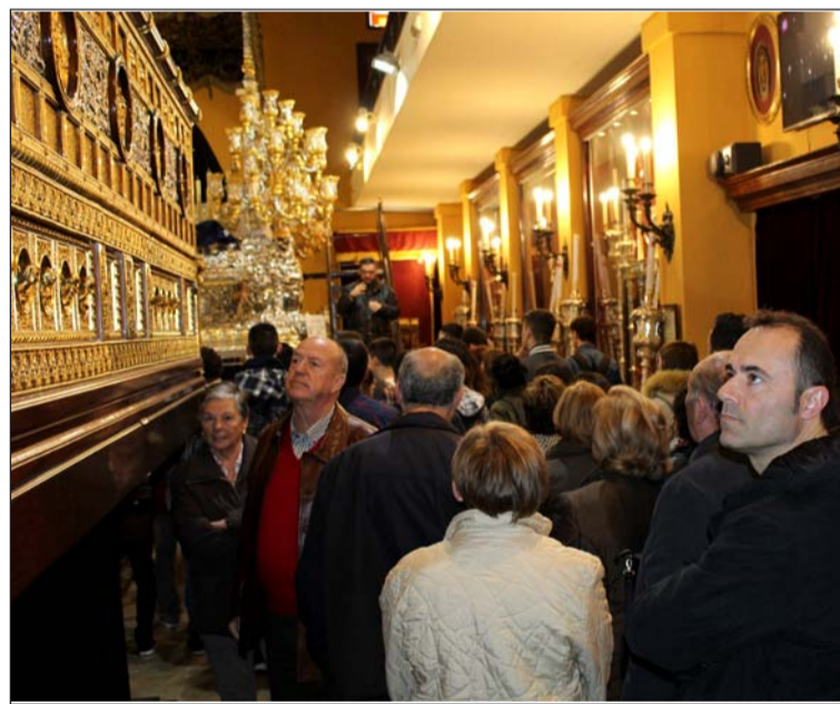
En el salón de tronos de la Archicofradía de la Expiración.

Entidades colaboradoras con esta publicación: