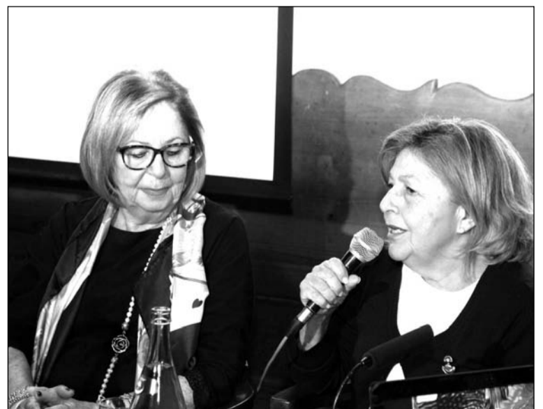
Un instante del acto académico celebrado en El Pimpi.