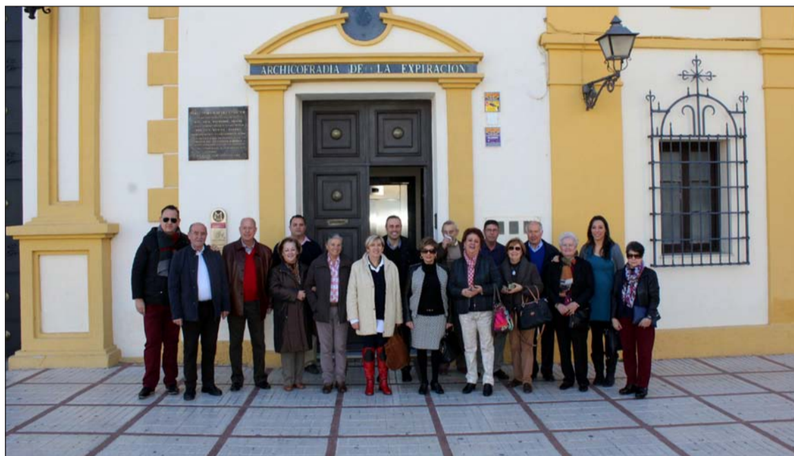
Peñistas en el exterior de la Casa Hermandad de la Expiración.