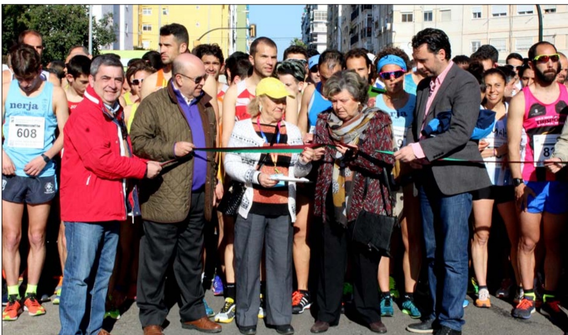
Instante en que se corta la cinta antes de dar la salida a la prueba.