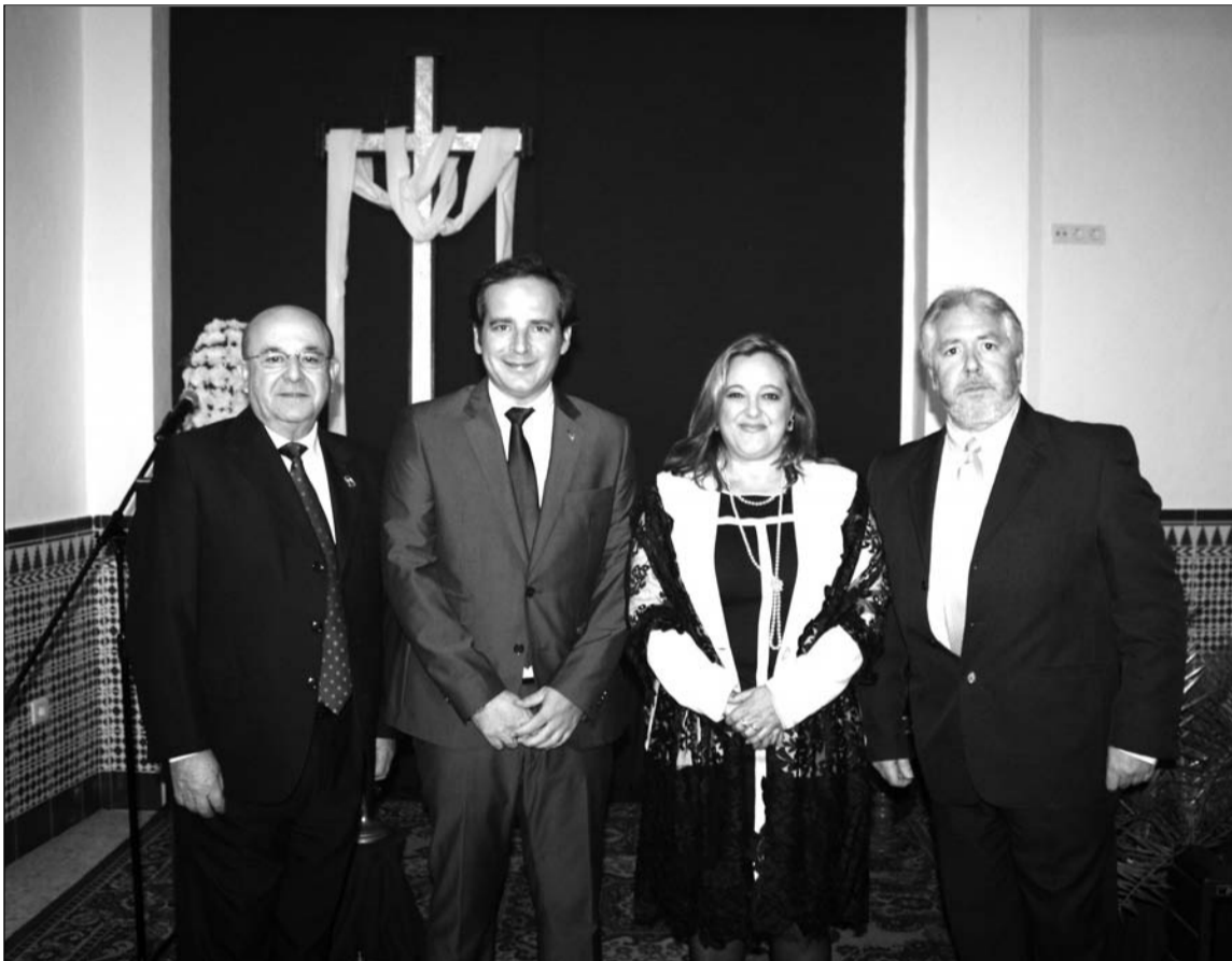
Instantes previos al inicio de la I Exaltación de la Mantilla de Avecija.