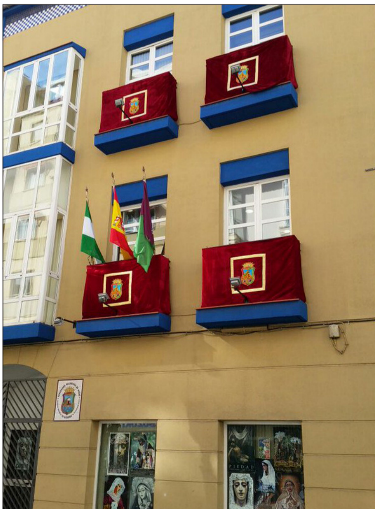
Fachada de la sede de la Federación de Peñas, con sus nuevas colgaduras.

C/. Carretería, N° 6 - Málaga - Tel.: 952 12 22 30