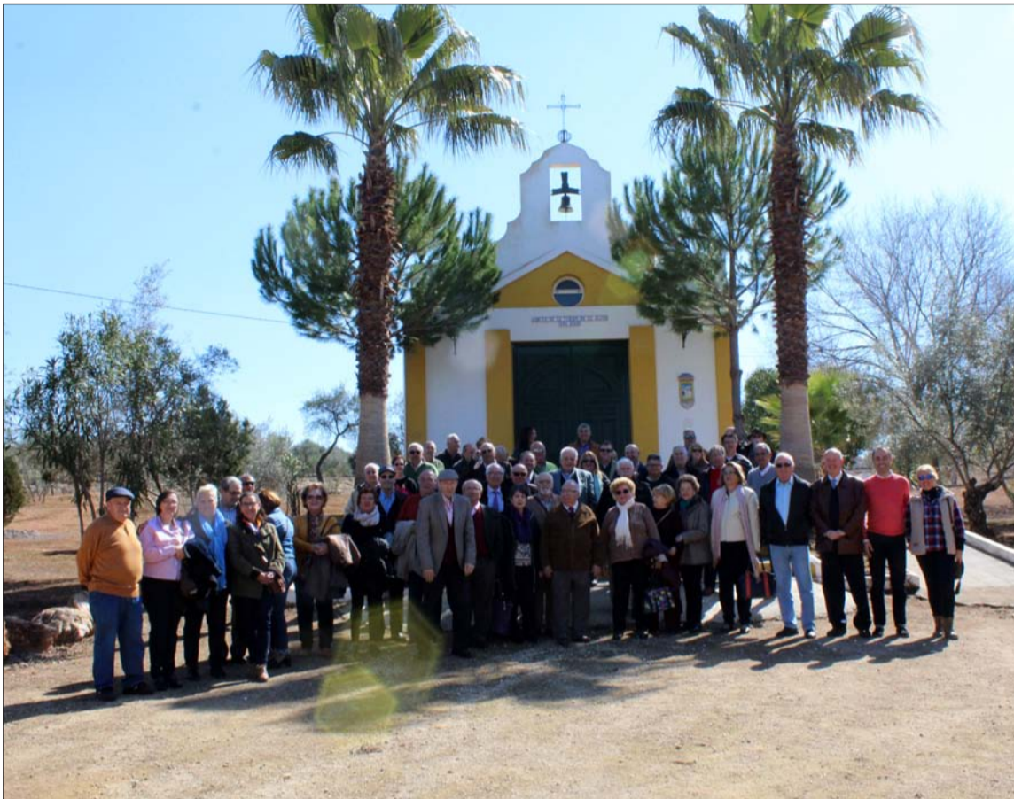
Peñistas ante la Ermita del Parque Santillán, donde se celebrará el encuentro con los peñistas de Córdoba.