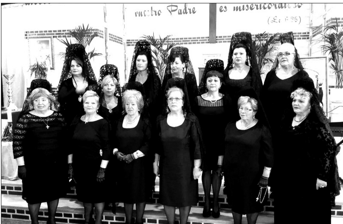
Algunas de las numerosas mantillas que participaron en esta actividad.

Tras este acto, los asistentes se desplazaban a la sede para degustar potaje y torrijas