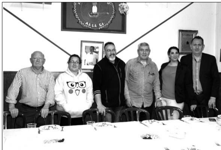
Imagen de la comida de hermandad del 12 de marzo en la Peña Er Salero.

La Peña Er Salero ha celebrado durante dos fines de semanas consecutivos comidas de hermandad entre sus socios, siendo la del 19 de marzo dedicada al Día del Padre. En ambas ha estado representada la Federación de Peñas.