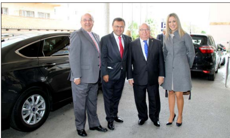
El diputado Miguel Ángel Heredia también participó.