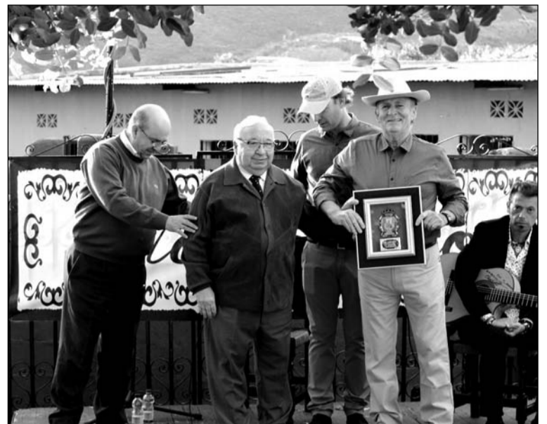
Entrega de un recuerdo por parte de la Federación de Peñas.