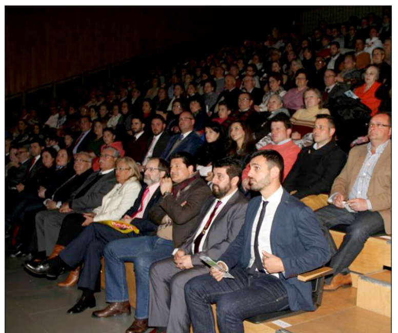
El Auditorio Edgar Neville completó su aforo.