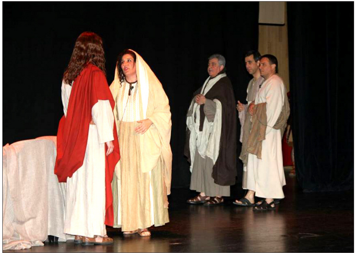
Un instante de la representación del Paso de Riogordo.

Desde su primera representación en 1951, El Paso de Riogordo ha gozado de una gran respuesta por parte de los aficionados a la Semana Santa, basta con mencionar que en su última edición contó con más de 10.000 personas en el público. Este éxito ha tenido también su