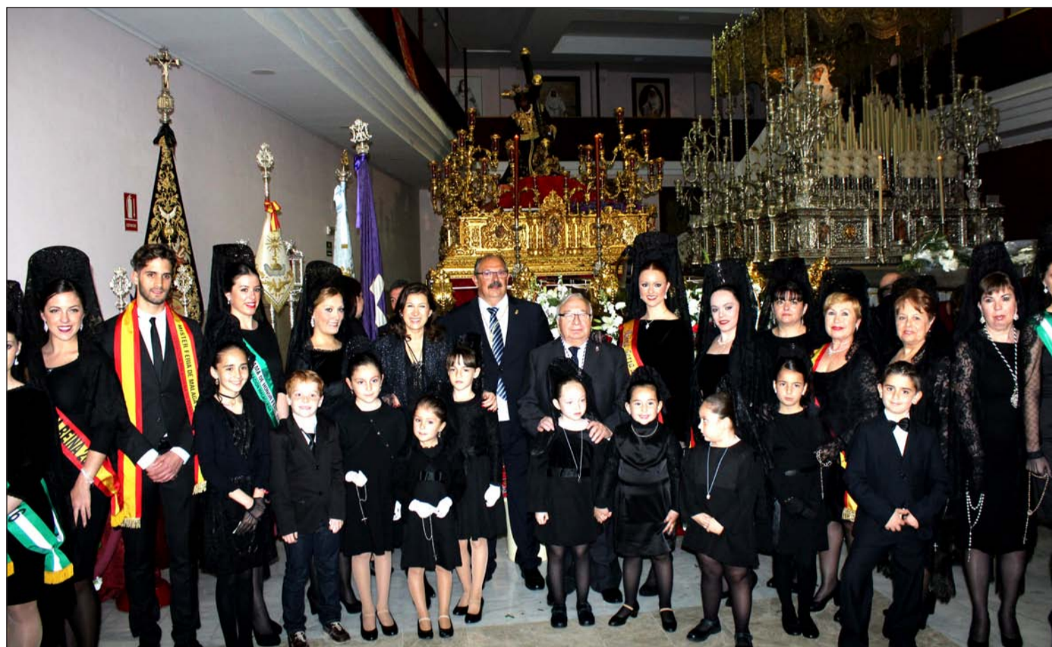
La Federación Malagueña de Peñas participó el pasado Lunes en la Ofrenda Floral 'Un Clavel para el Rocío', con la presencia de muchos jóvenes y niños.

Número 596 23 de Marzo de 2016 C/ Pedro Molina, 1 Tfno: 952 22 54 39 Fax: 952 21 48 82 E-mail: prensa@femape.com - la_alcazaba@hotmail.com Web: www.femape.com Edición digital: www.femape.com/laalcazabadigital Twitter: @FMPLaAlcazaba Facebook: www.facebook.com/FMPLaAlcazaba