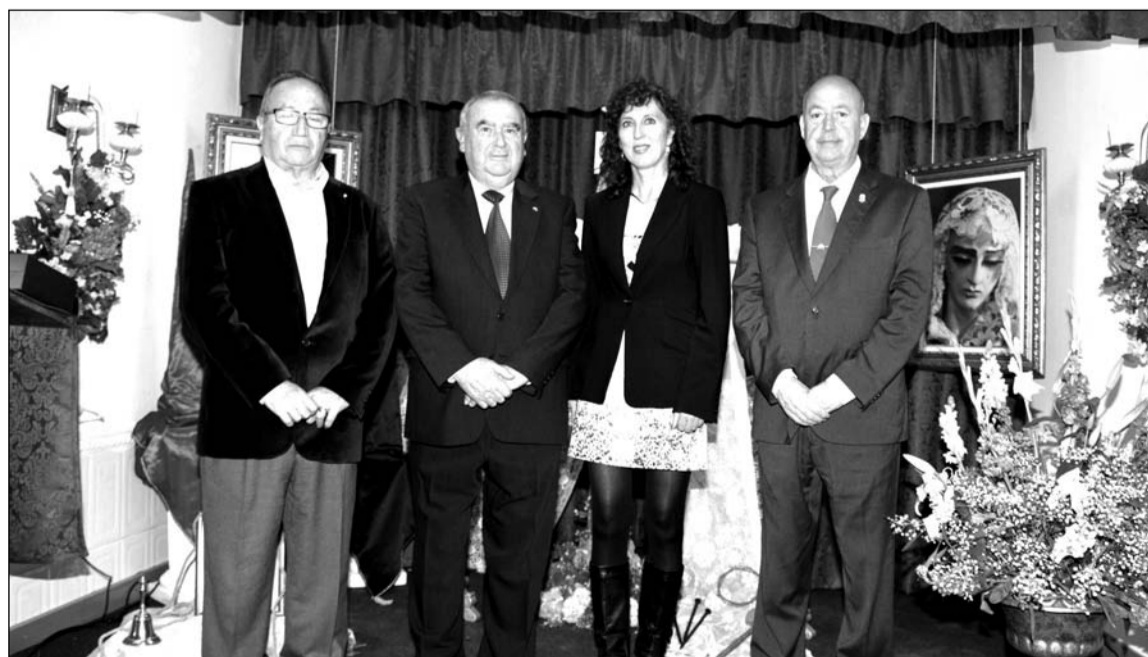
Asistentes a la exaltación de la Semana Santa en la Asociación de Amigos del Toreo de Churriana.

Dos grandes fotografías de los Sagrados Titulares de la Cofradía de Churriana, el Nazareno del Paso y la Virgen de los Dolores, presidían el escenario preparado expresamente para la ocasión.