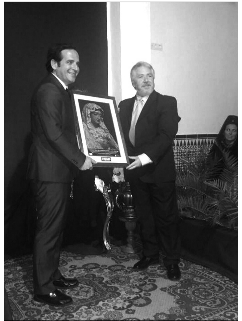
El presidente de la entidad entrega un cuadro al pregonero.