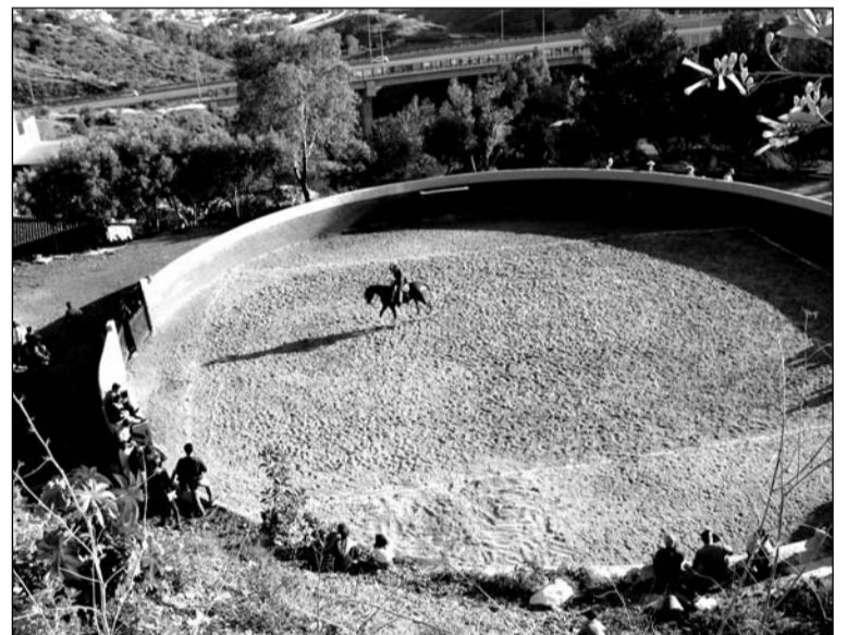
Vista de la plaza de tientas de la sede, donde se realizó la exhibición.