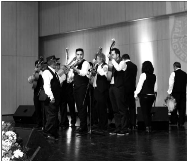
Panda de Verdiales Primera de Los Montes.