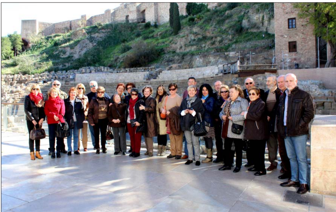
Imagen de grupo ante el Teatro Romano, en la calle Alcazabilla.