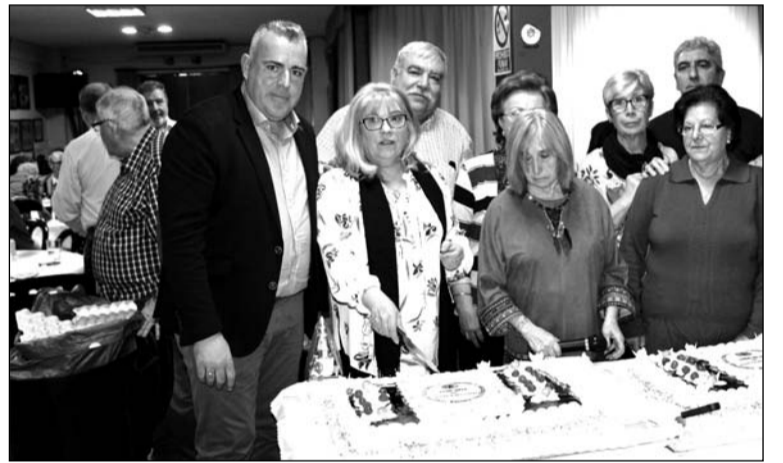
Corte de la tarta conmemorativa del sesenta aniversario de la entidad.