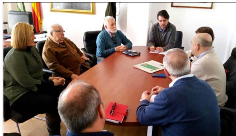
Reunión con las autoridades de Mollina.

Entidades colaboradoras con esta publicación: