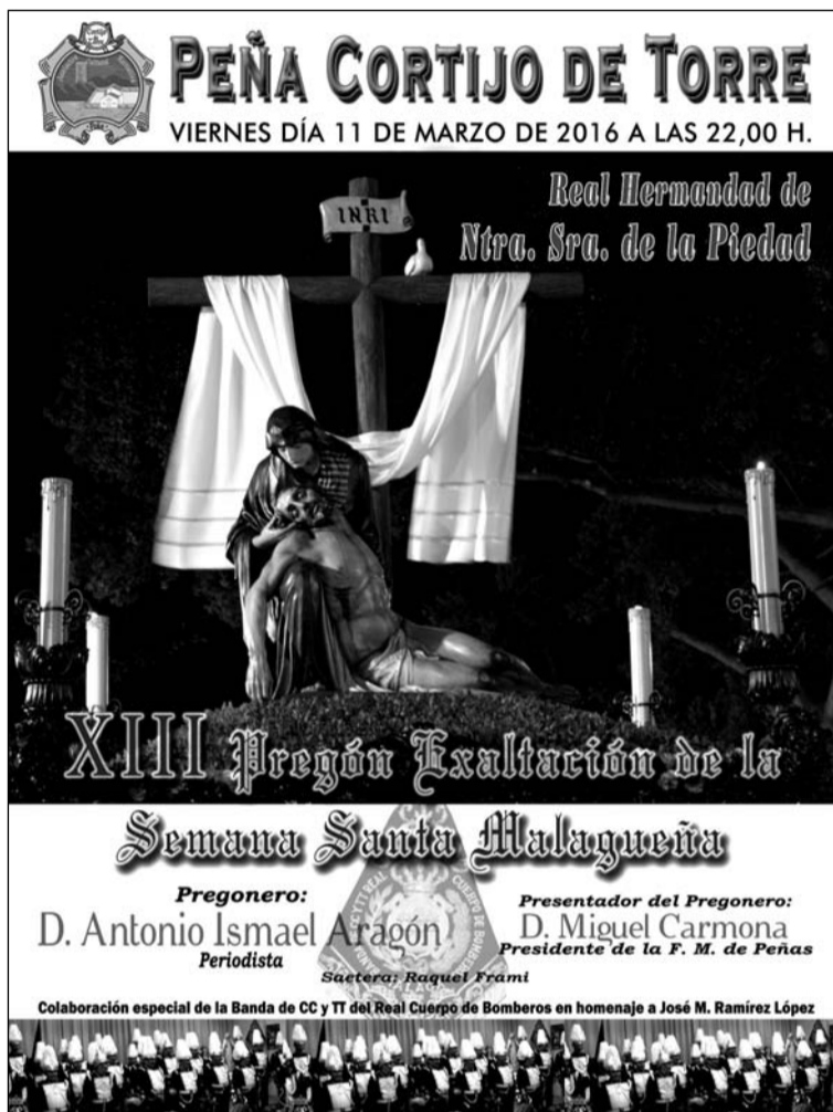
Cartel de la exaltación, dedicado a la cofradía de La Piedad.