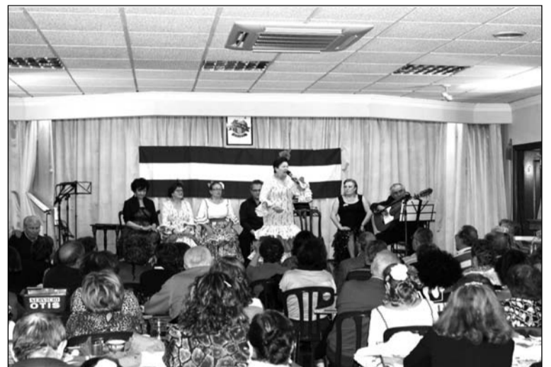
Una de las actuaciones del Día de Andalucía.