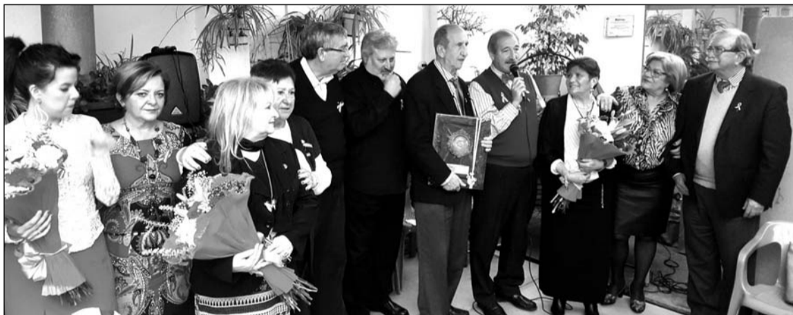
Celebración del Día de Andalucía en el patio de la sede de la entidad.