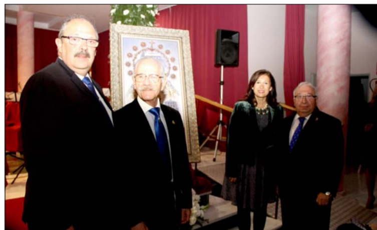
El presidente de la Federación, en la Exaltación de 'Un clavel para el Rocío'.

Por ello, al igual que en años anteriores, se invita a todas las entidades federadas para que se sumen a esta ofrenda floral, quedando citados en