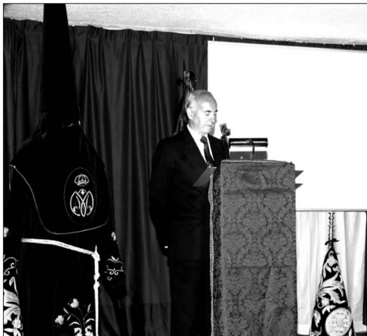
Un instante del pregón celebrado el pasado 5 de marzo.

La Peña Er Salero ha convocado a sus socios el próximo sábado 12 de marzo para compartir una comida de hermandad en su sede desde las 14 horas en la sede de la entidad.