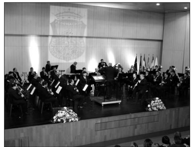
Banda Municipal de Música de Málaga.