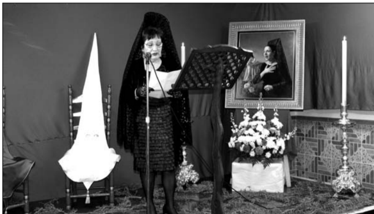
La pregonera, durante un instante de su intervención