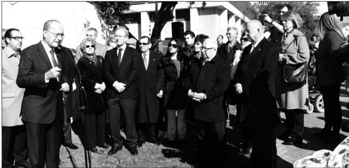
Intervención del alcalde ante las autoridades asistentes al acto.