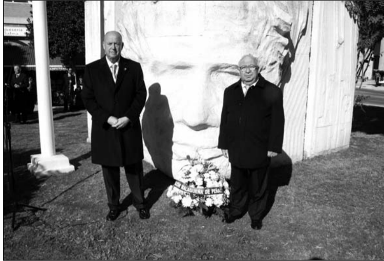
Ofrenda floral de la Federación de Peñas a Blas Infante.

les realizaron una ofrenda floral y la Banda Municipal de Música interpretaba los himnos de Andalucía y de España.