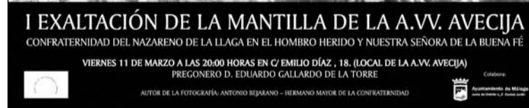
Cartel de la primera exaltación de esta asociación vecinal.