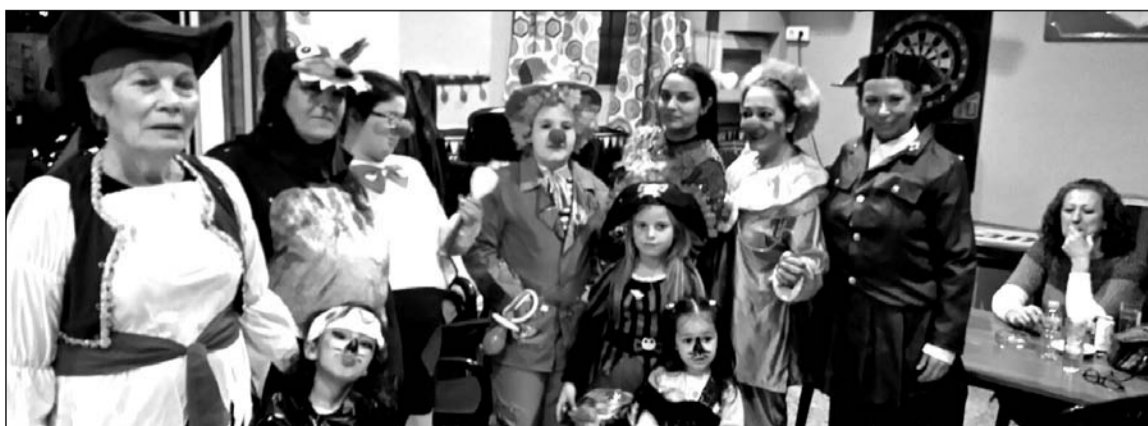
Niños y mayores disfrazados en la sede de la Peña La Solera.

Igualmente, el Viernes Santo se servirá un Potaje de Semana Santa.