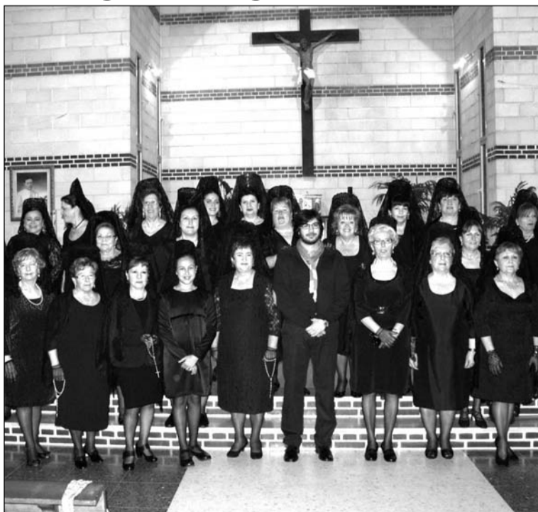
Algunas de las numerosas mantillas que participaron el pasado año.