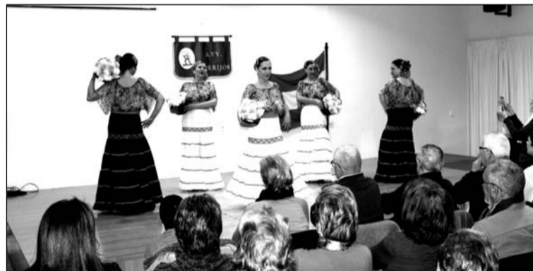
Una de las actuaciones del acto de la tarde.