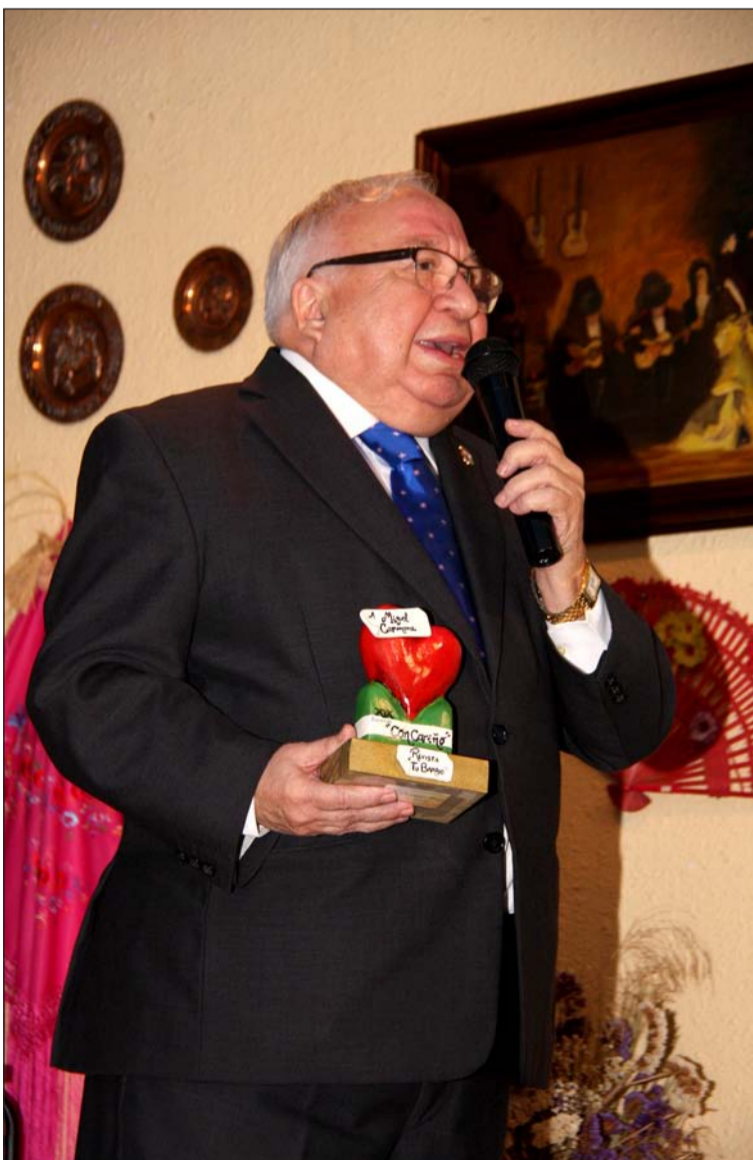
El presidente de la Federación agradece el premio recibido.