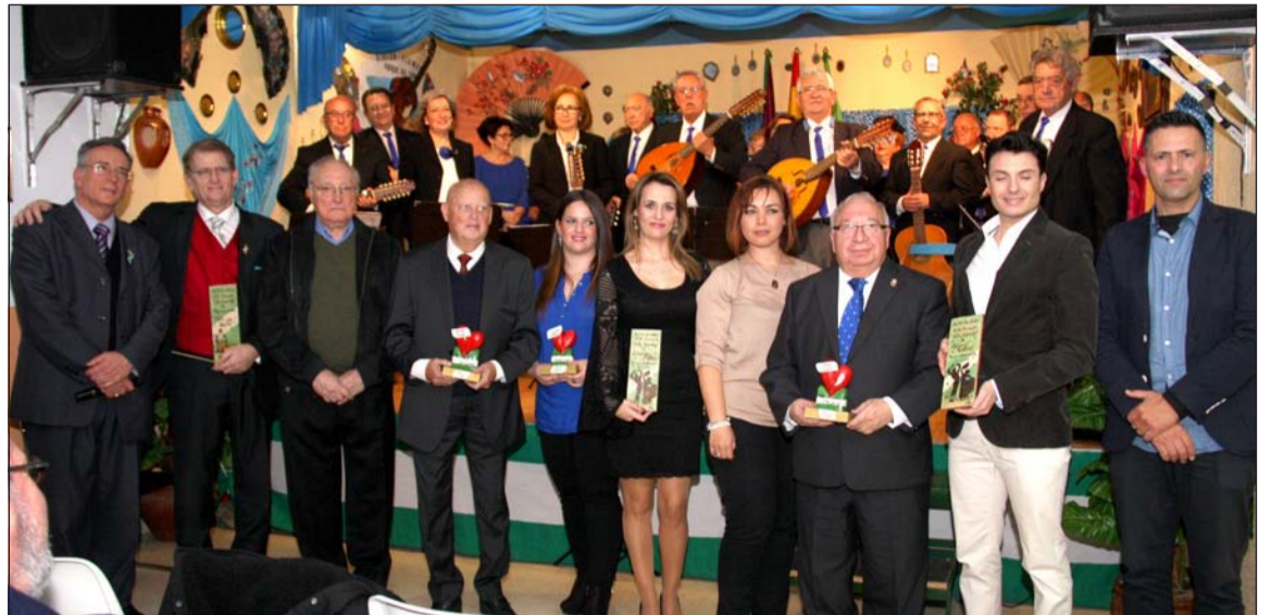
Galardonados con representantes de la asociación y la agrupación musical al fondo.

El acto estuvo acompañado por la presencia de distintas autoridades locales, y fue amenizado por la Agrupación Músico Vocal 'Pan con Aceite' y por alumnos de la escuela de copla de Pedro Gordillo.