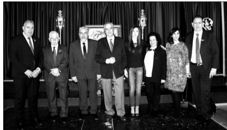
Asistentes al pregon de la Peña Blanquiazul.