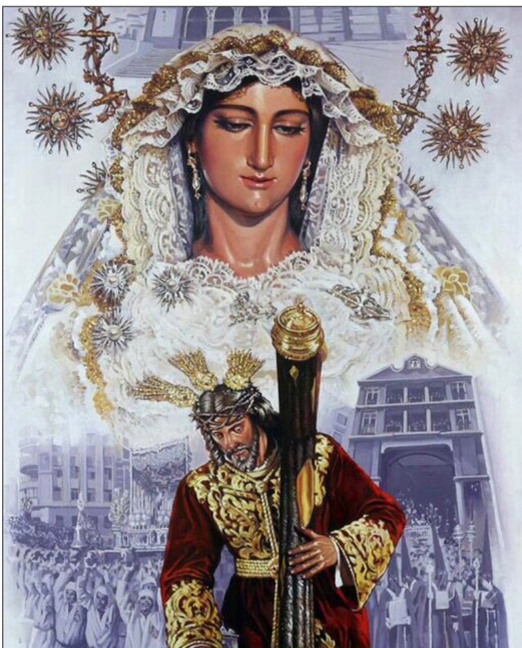
Detalle del cartel realizado por Pepe Palma para la ofrenda.