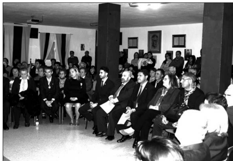
Acto cofrade en la barriada de San Andrés.