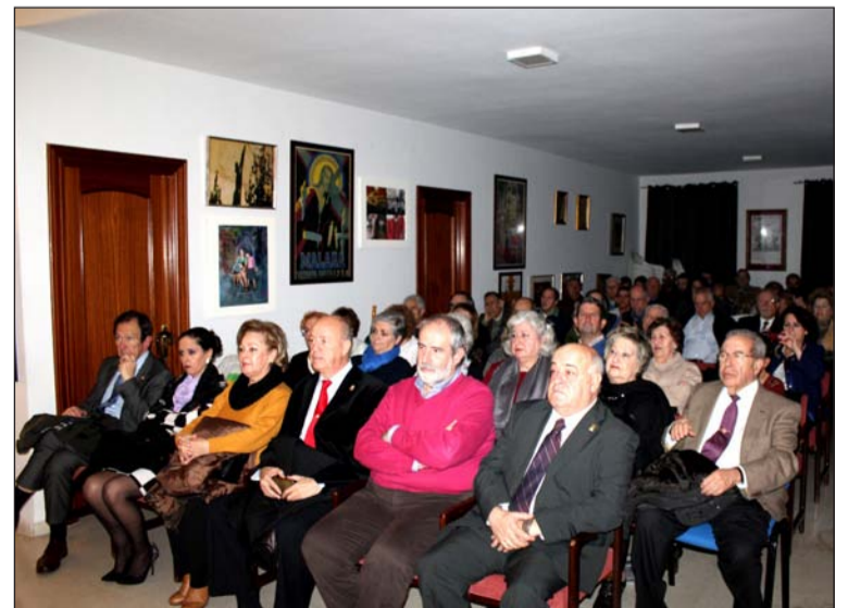
Imagen del público en la segunda semifinal.

La entrega de premios, como es también tradicional, tendrá lugar al sábado siguiente, el 19 de marzo, coincidiendo con la Misa del Alba y posterior traslado de Nuestro Padre Jesús Cautivo y María Santísima de la Trinidad Coronada.