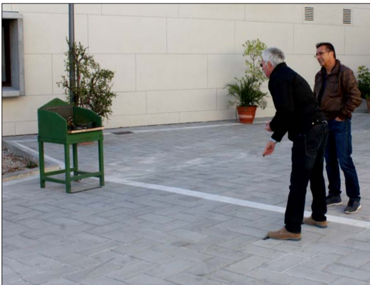
Un lanzamiento a la rana en el exterior del centro.