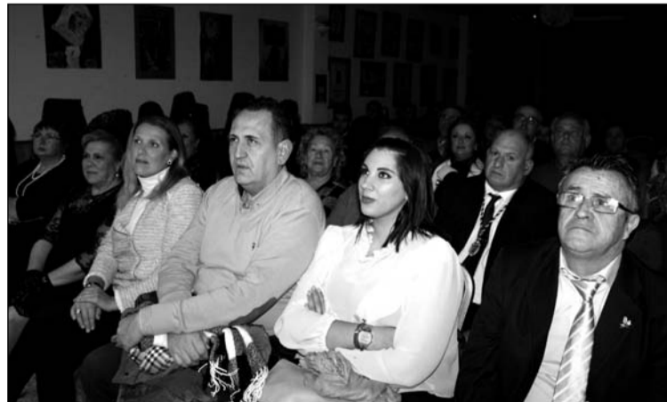
La presidenta, de mantilla, con algunos de los invitados al acto.