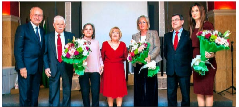
Acto del aniversario con autoridades en Rincón de la Victoria.

Una semana después, el pasado viernes 5 de marzo, la celebración del aniversario tenía continuidad en su sede, donde el presidente de la Federación hacía entrega de un cuadro conmemorativo.