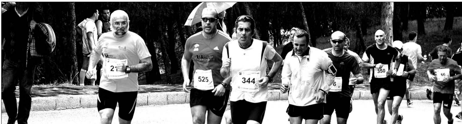
Corredores ascienden al Castillo de Gibralfaro en una edición anterior de esta prueba.