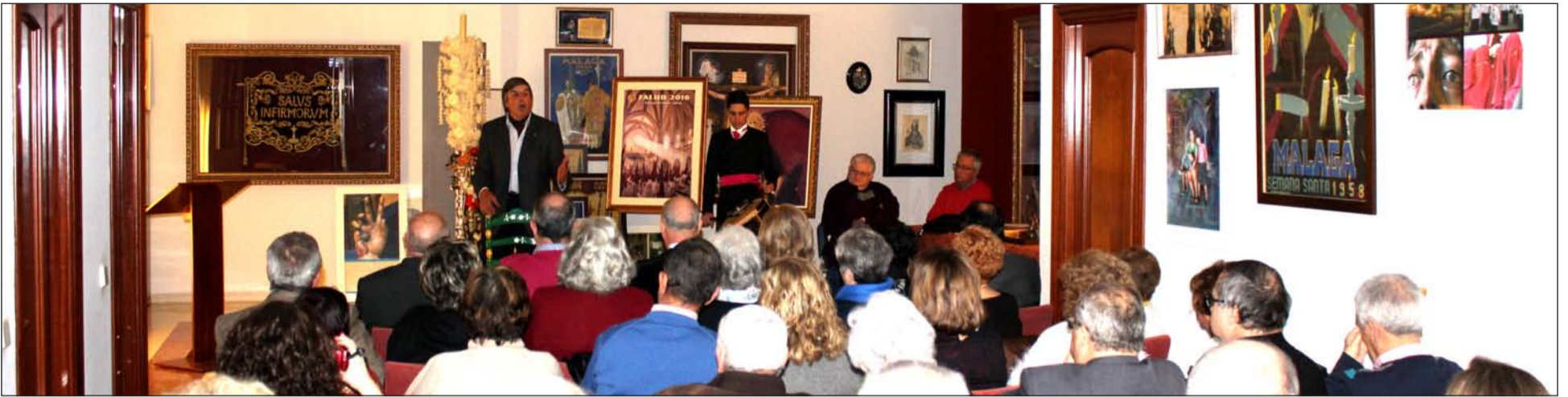
Imagen de la segunda semifinal, celebrada en la Casa Hermandad de la Cofradía de la Salud.