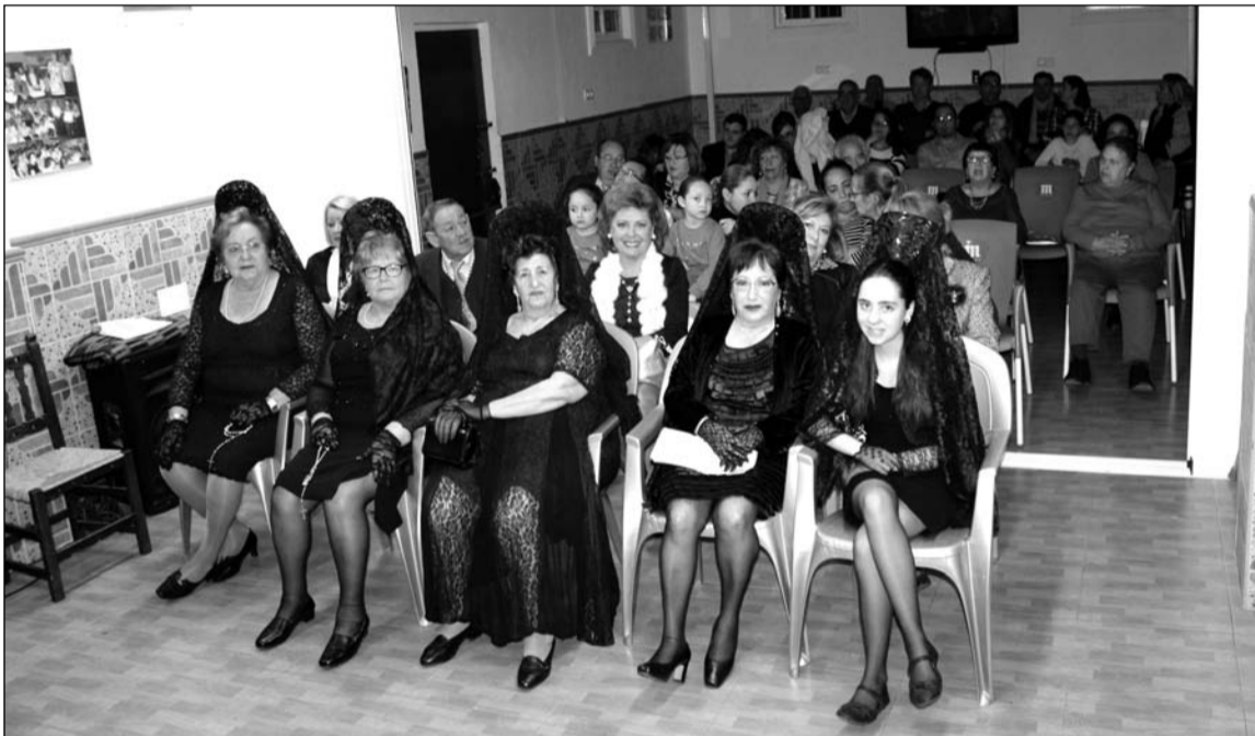
Algunas socias acudieron al acto ataviadas con la clásica mantilla.