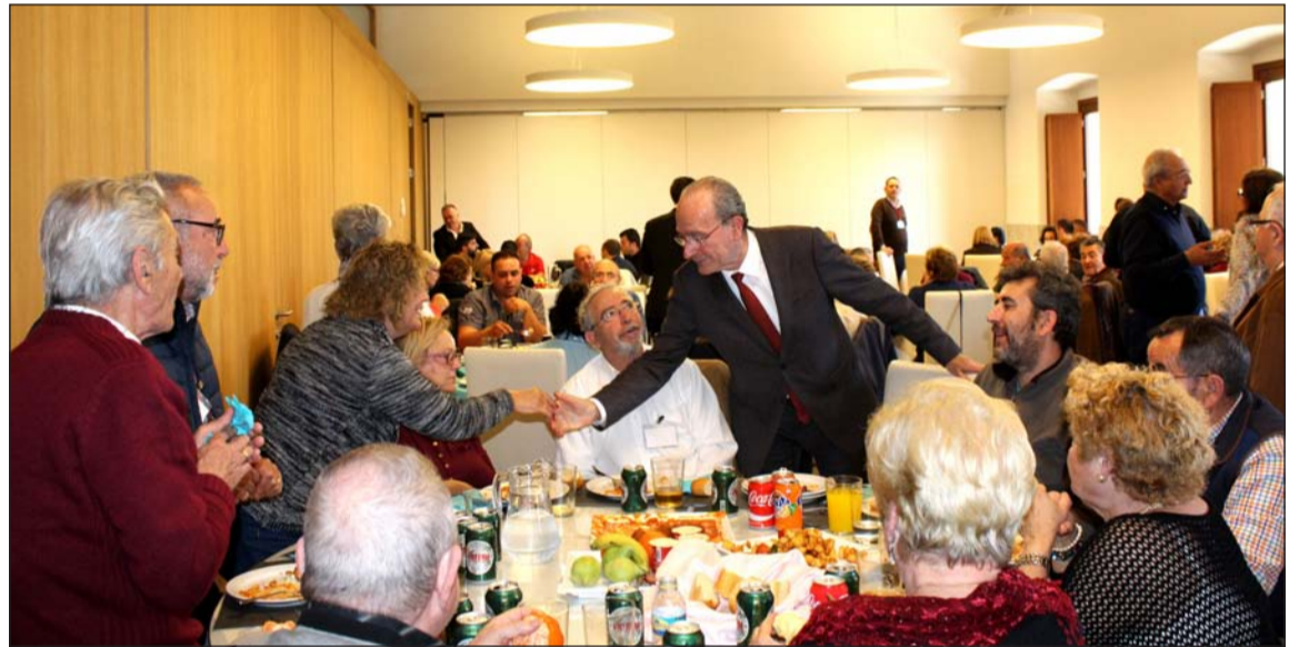
El alcalde saluda a los peñistas durante el almuerzo.

Una vez concluido el almuerzo, comenzaron a reanudarse a continuación las partidas restantes, en los instantes de mayor emoción al disputarse las finales. La primera en concluir fue la de rana.