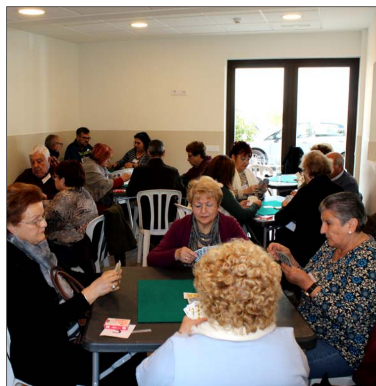
Imagen de la competición de chinchón.