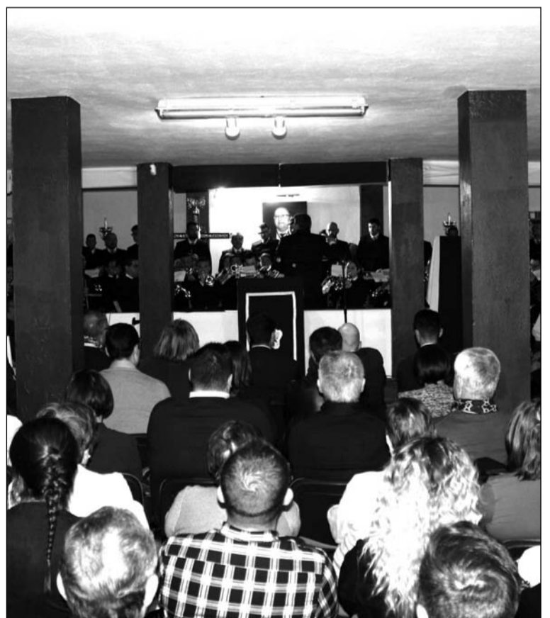
Se contó con la actuación de la banda del Cautivo.