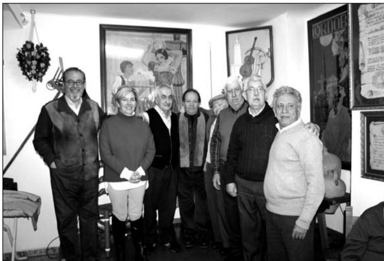
Asistentes a esta actuación, con los artistas anunciados.