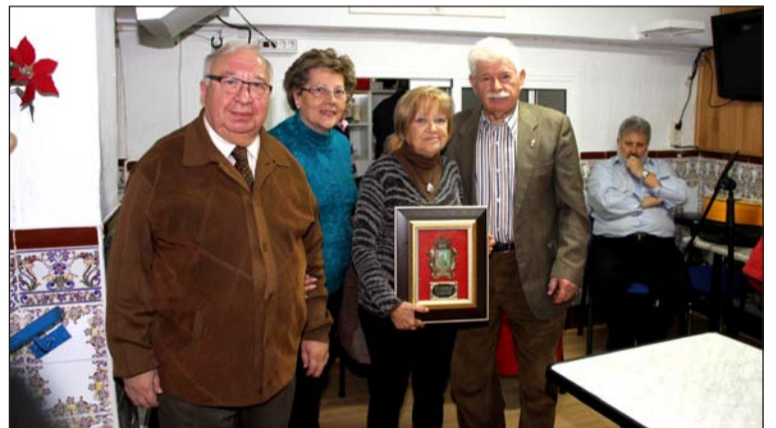
Los presidentes de la Federación y la Peña Los Rosales, con sus esposas.