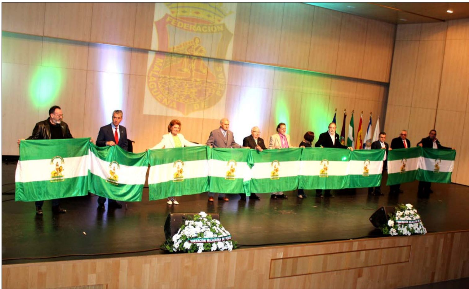
Acto de entrega de banderas de Andalucía en el Auditorio Edgar Neville de la Diputación el pasado 28 de febrero.

Número 595 9 de Marzo de 2016 C/ Pedro Molina, 1 Tfno: 952 22 54 39 Fax: 952 21 48 82 E-mail: prensa@femape.com - la_alcazaba@hotmail.com Web: www.femape.com Edición digital: www.femape.com/laalcazabadigital Twitter: @FMPLaAlcazaba Facebook: www.facebook.com/FMPLaAlcazaba