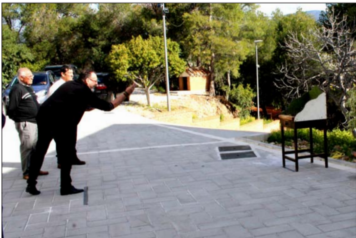
Imagen de la competición celebrada el 5 de marzo en el Seminario.