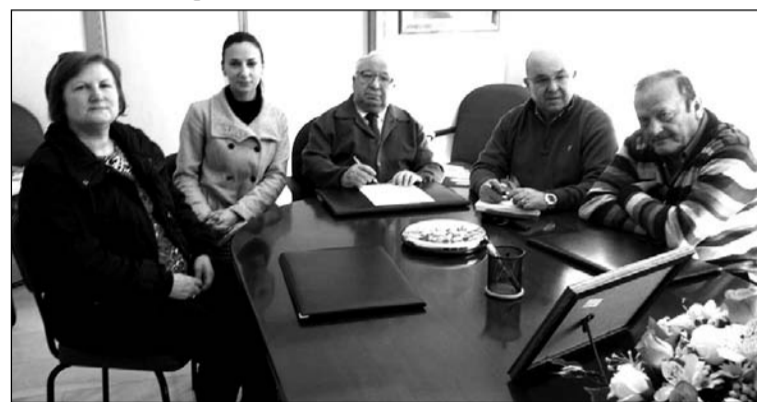
Un instante de la reunión mantenida en la sala de juntas.

Ésta será la segunda entidad federada de Torre del Mar junto a la Peña Las Columnas.