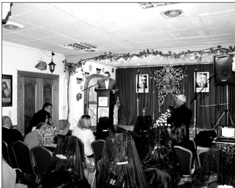
Un instante del pregón de la Peña El Parral.