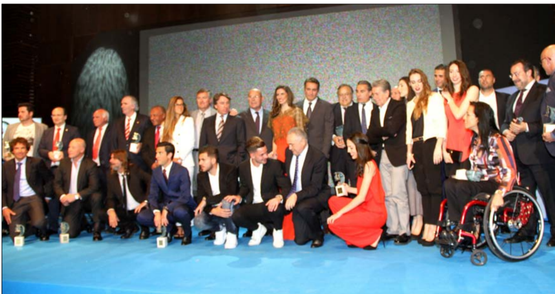
Galardonados durante la gala celebrada en el Palacio de Ferias.

También ejerció de embajador el veleño Fernando Hierro, máximo exponente de los jugadores andaluces que han sido internacionales con la selección absoluta de fútbol.