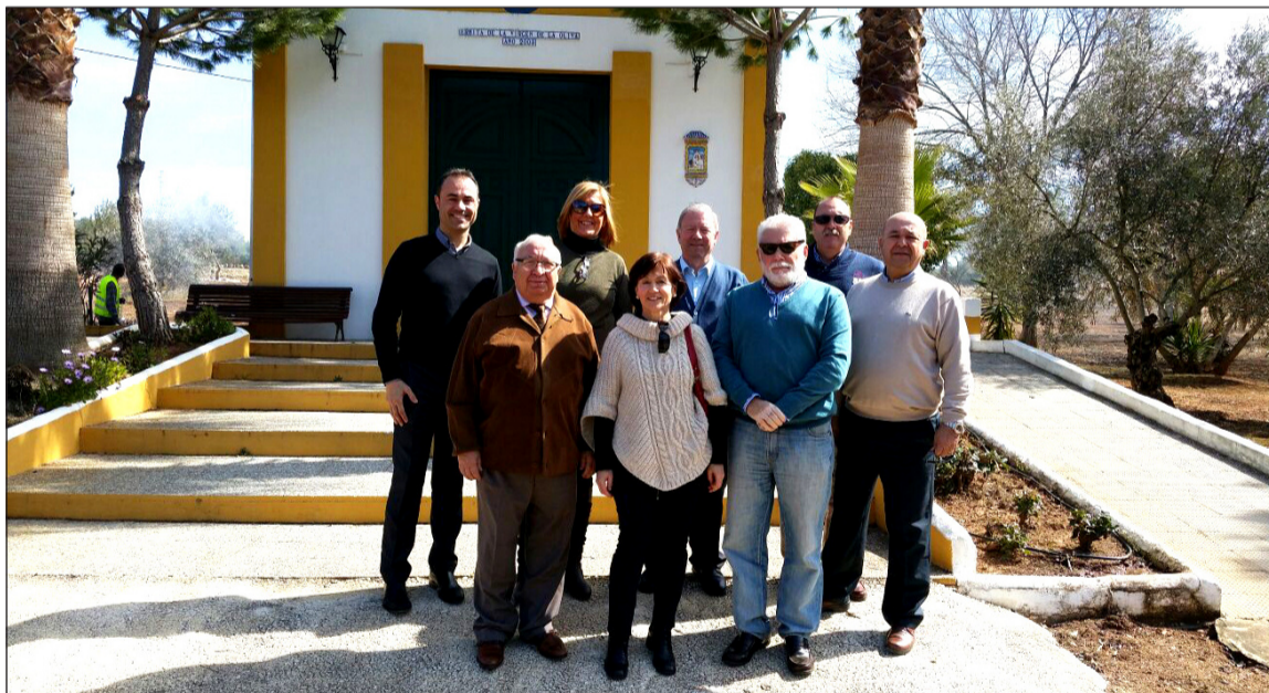
Representantes de las dos federaciones ante la capilla del Parque Santillán.

Desde la comisión creada por parte de las dos federaciones se calcula la presencia de unas cuatro mil personas en este evento, en el que se contará con la asistencia de autoridades locales, provinciales y regionales.