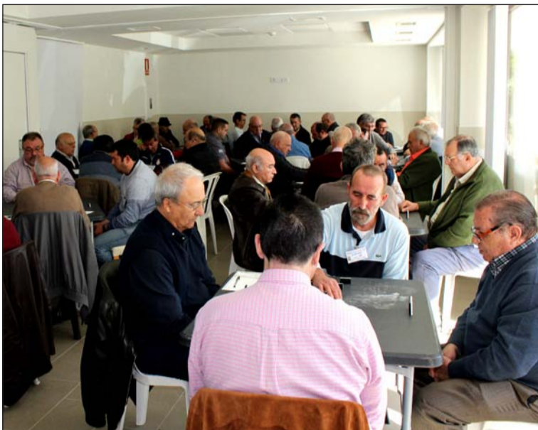
Partidas de dominó celebradas en el Seminario.