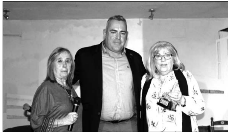
Entrega de un recuerdo por parte de la Federación de Peñas.