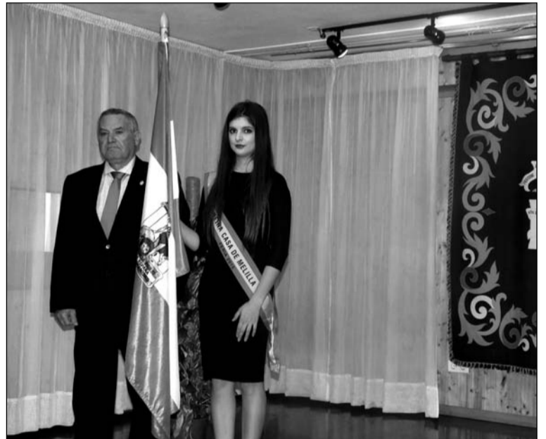
El presidente y la Reina de la Feria de la Casa de Melilla el 28 de febrero.