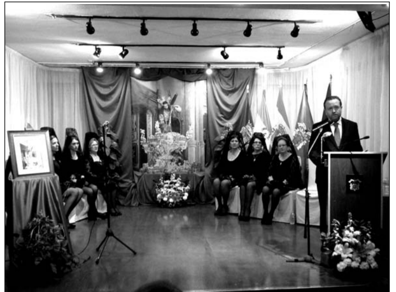
El pregonero, con mantillas al fondo del escenario.

Las actividades del mes de marzo en esta entidad se completan este viernes 11 con una Asamblea General Ordinaria, y el día 19 con un almuerzo-potaje con motivo del Día del Padre.