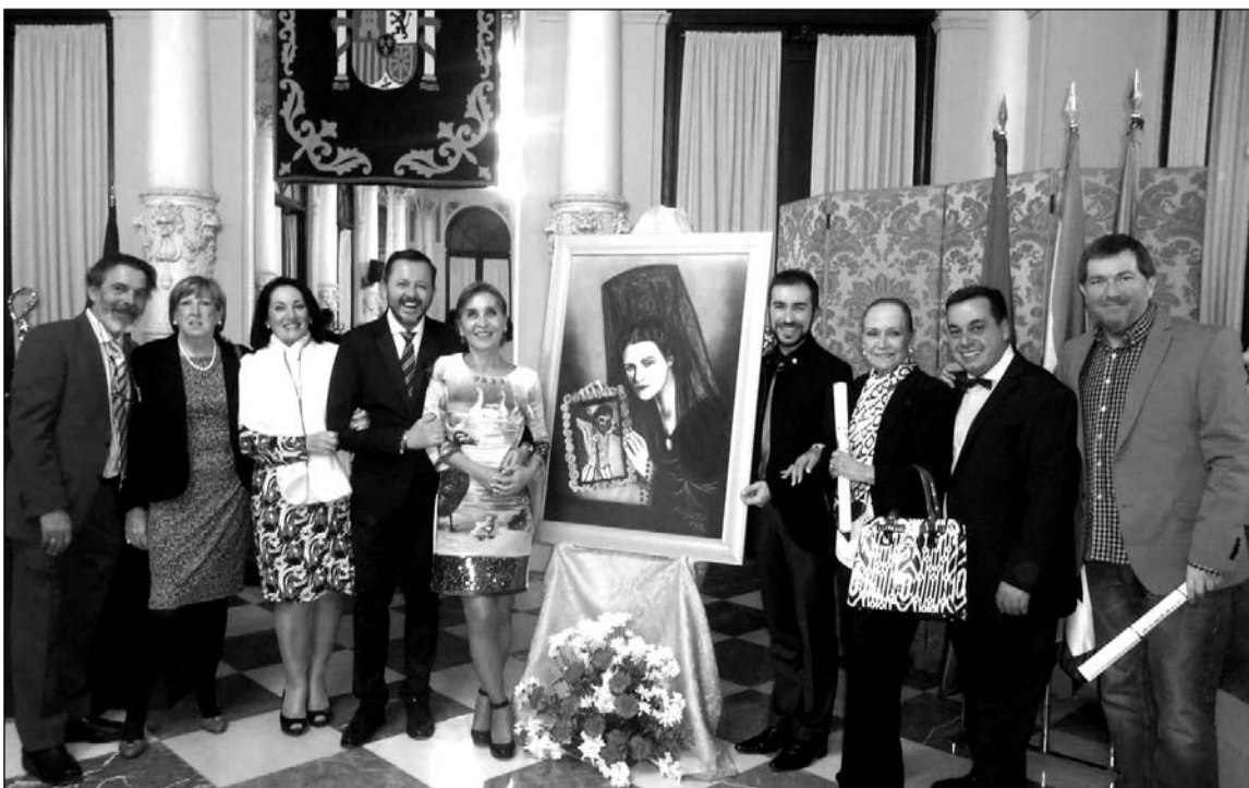
Acto de presentación en el Patio de Banderas del Ayuntamiento de Málaga.