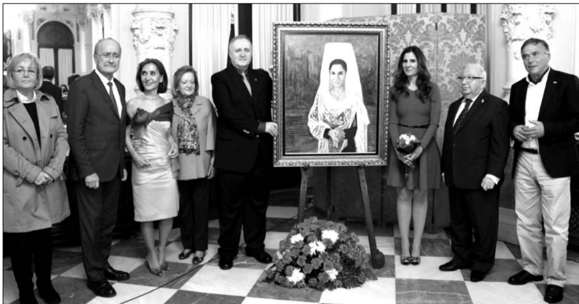
Acto de presentación del cartel en el Salón de los Espejos del Ayuntamiento.