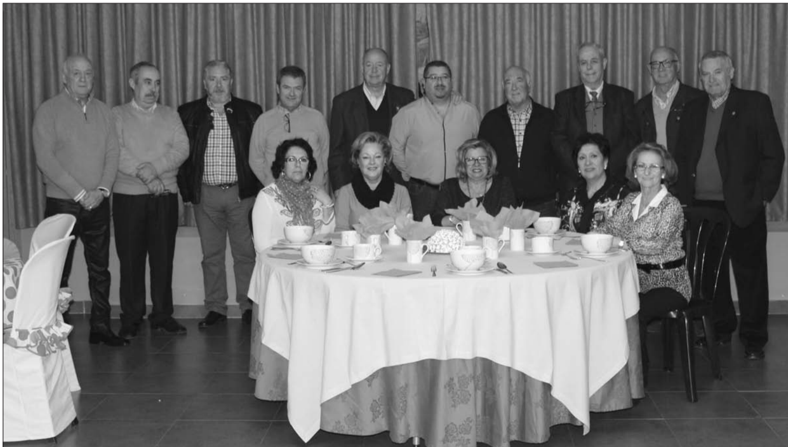
Clausura del Taller de Costura y Confección, en el que se han creado mantelerías para la propia sede de la Peña La Biznaga.