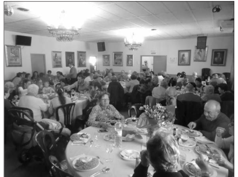
Aspecto que presentaba la sede durante las Migas Biznagueras.