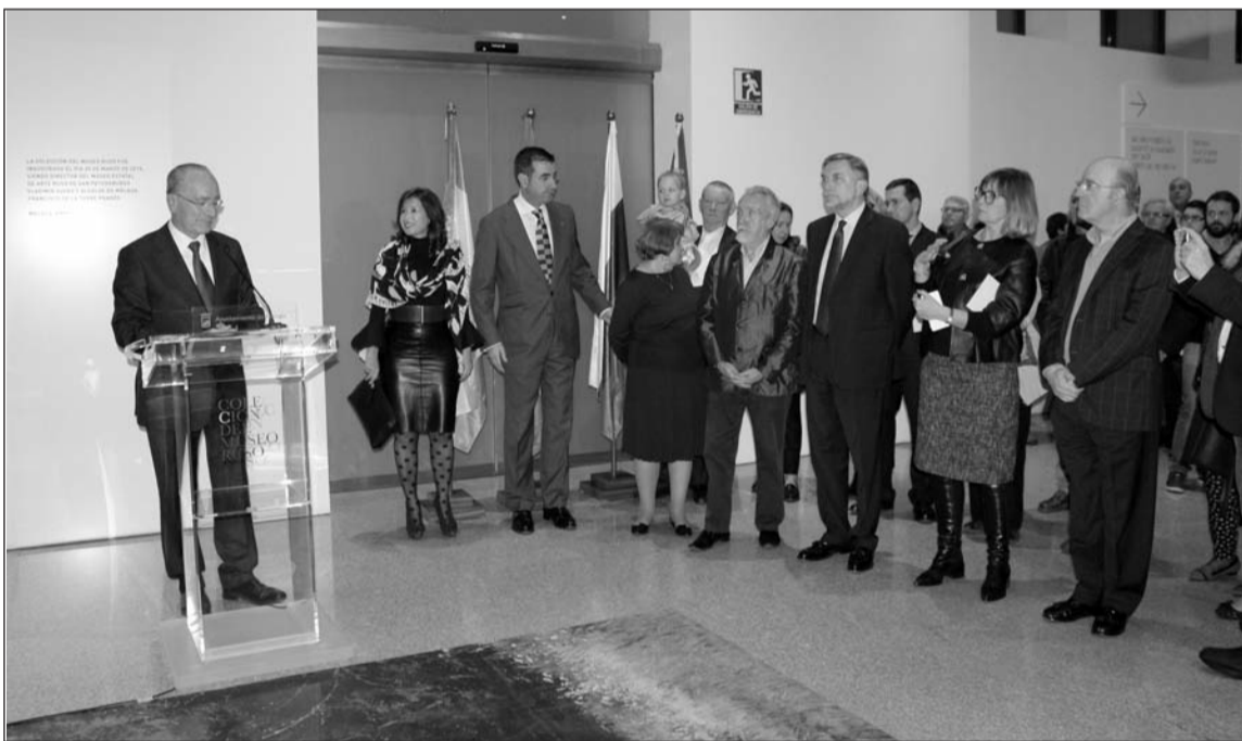
Intervención del alcalde de Málaga durante el acto de inauguración de la nueva colección.

Los artistas, escritores, poetas y músicos encontraron inspiración tanto en los caminos otoñales, sumidos en la espesa niebla (Arjip Kuindzhi), como en los árboles dorados que adornan los bosques (Isaak Levitán, Stanislav Zhukovskí, Aristarj Lentúlov y otros).