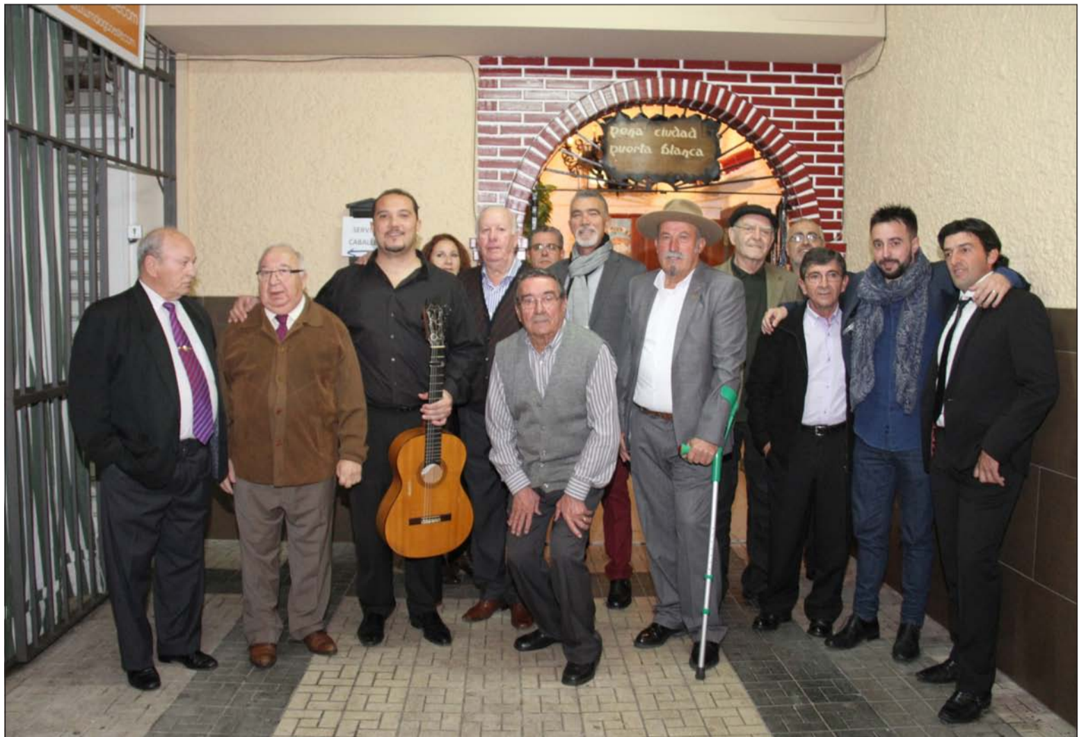
Imagen de grupo de la final del concurso.