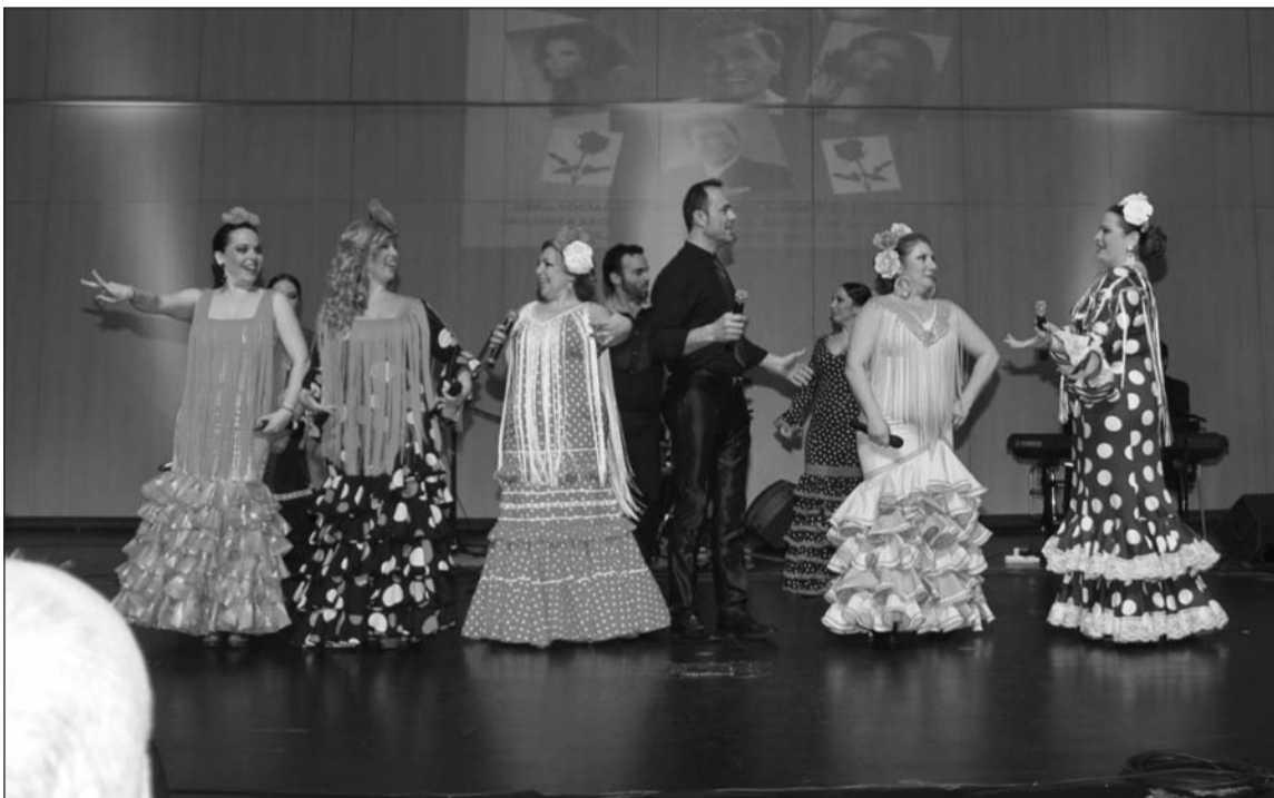
Elenco de artistas que participaron en el espectáculo.