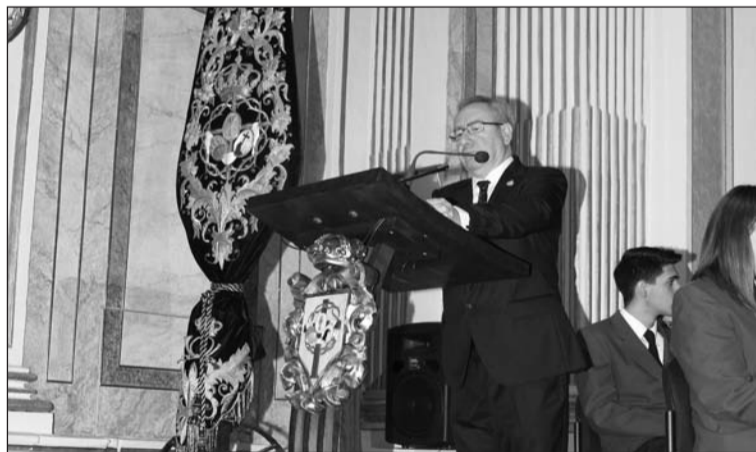
Un instante de la presentación del cartel de la Piedad.