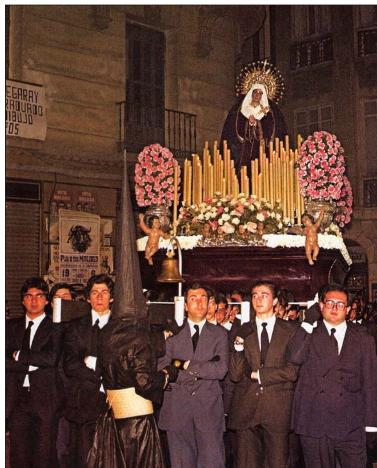
La Virgen de los Dolores de San Juan en su salida procesional de 1981.