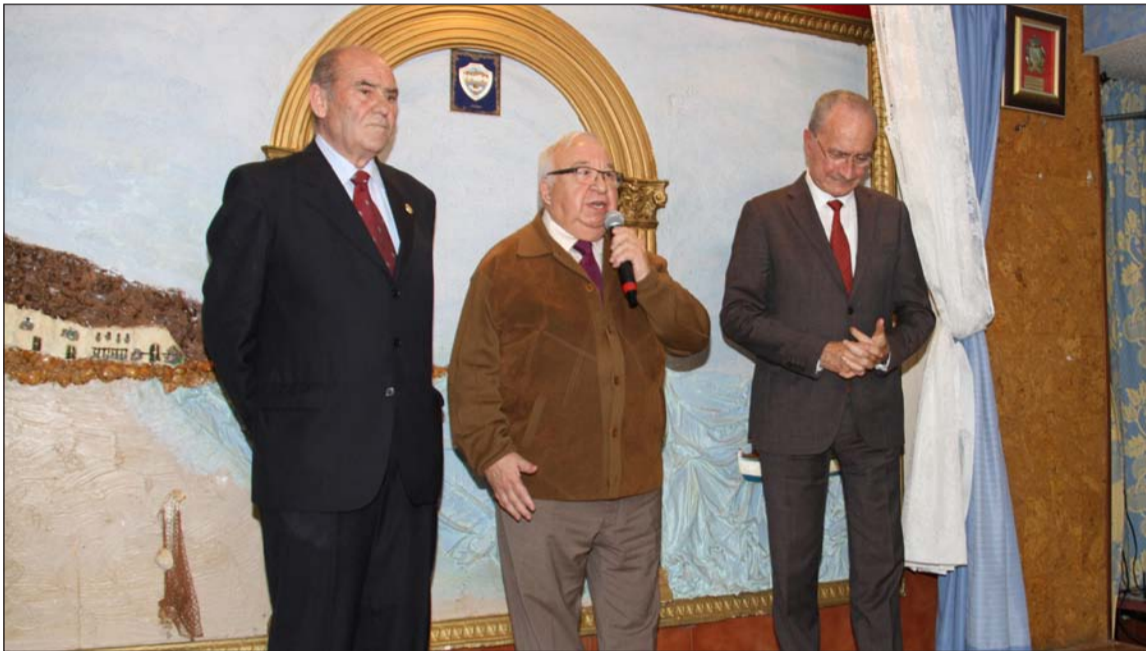
Intervención del presidente de la Federación, entre el presidente de la peña y el alcalde de Málaga.