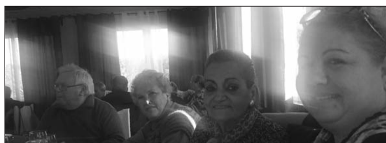
La presidenta de la Peña La Igualdad, con componentes de Los Ruiseñores.

ses hasta la localidad gaditana de Setenil de las Bodegas, donde pudieron realizar una visita turística y compartir el almuerzo.