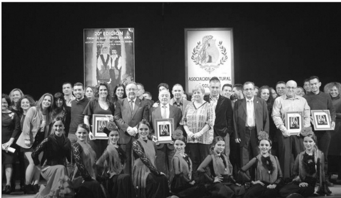
Galardonados con miembros de la entidad y autoridades presentes en el acto.