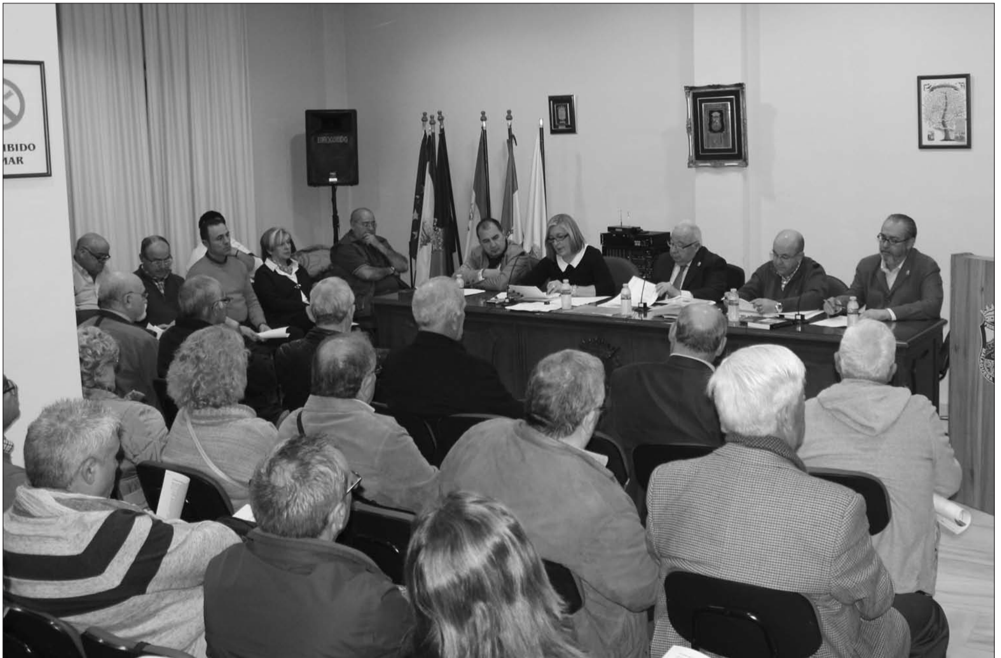
Asamblea General Ordinaria del pasado 25 de enero, en la que se aprobó posponer la aprobación de las cuentas del ejercicio 2015.