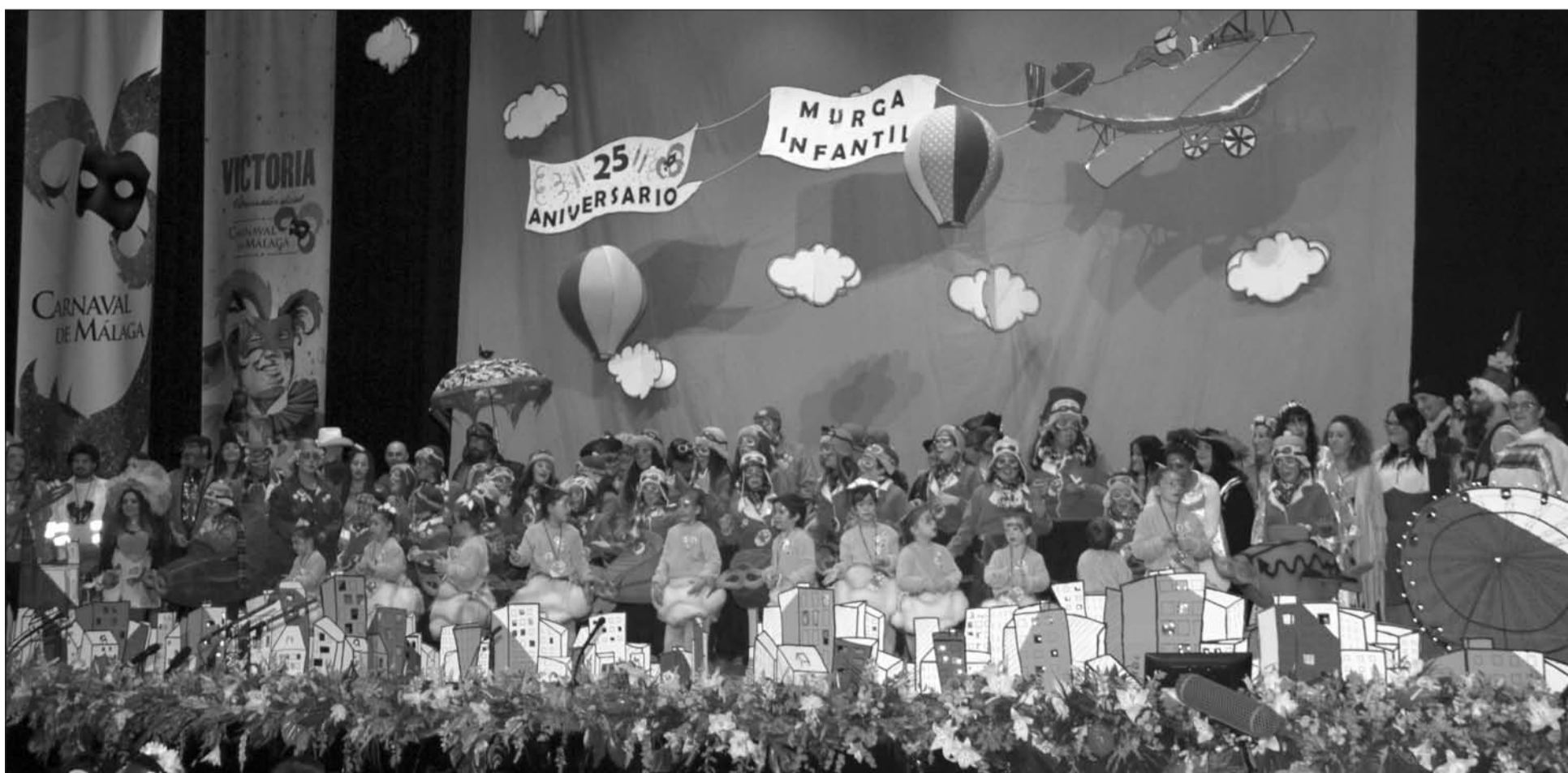
Los miembros de la Murga Infantil, con otros carnavaleros que han participado en esta formación durante sus 25 años de existencia.