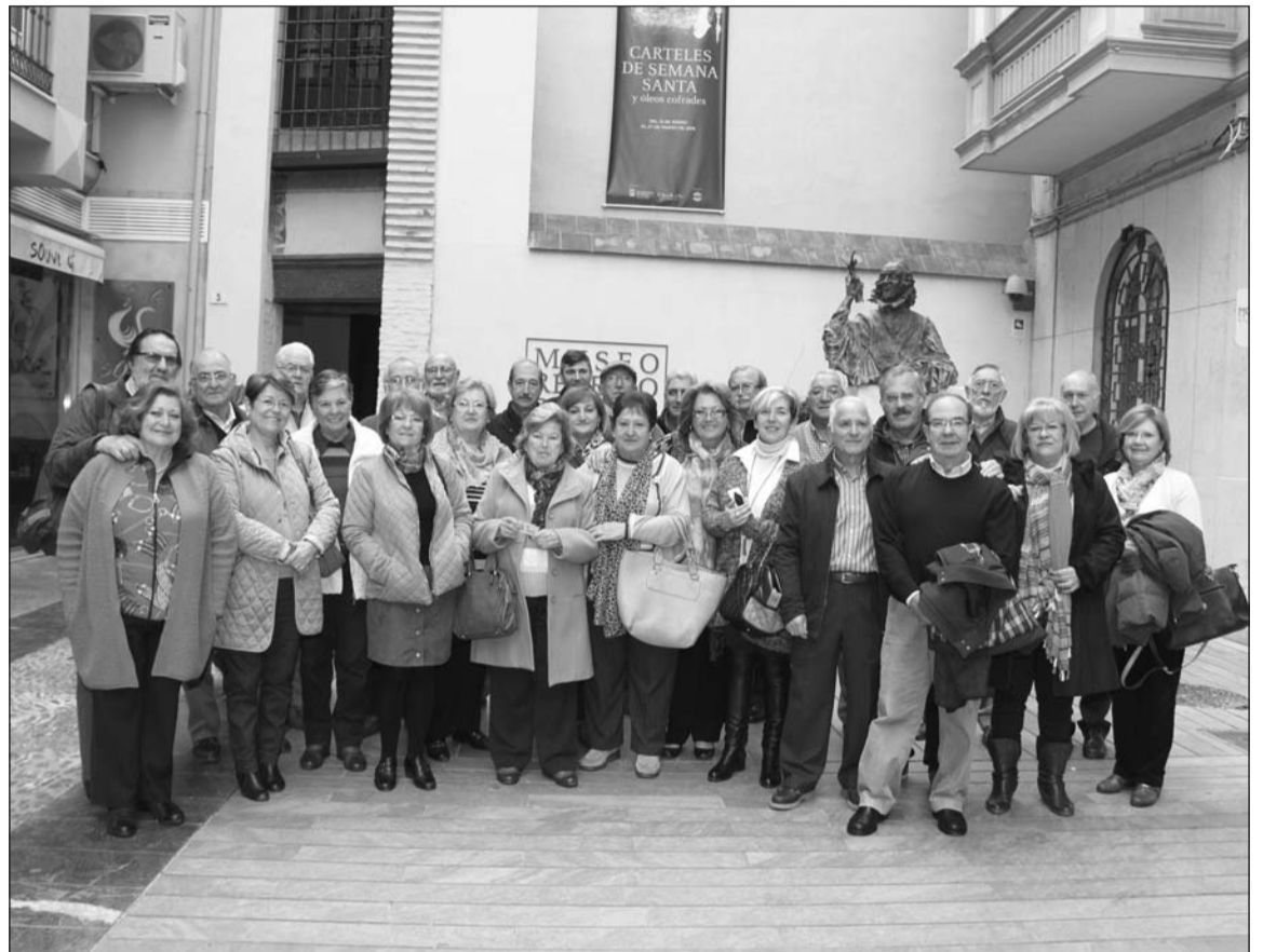
Segundo grupo organizado por la Federación Malagueña de Peñas para visitar el museo.