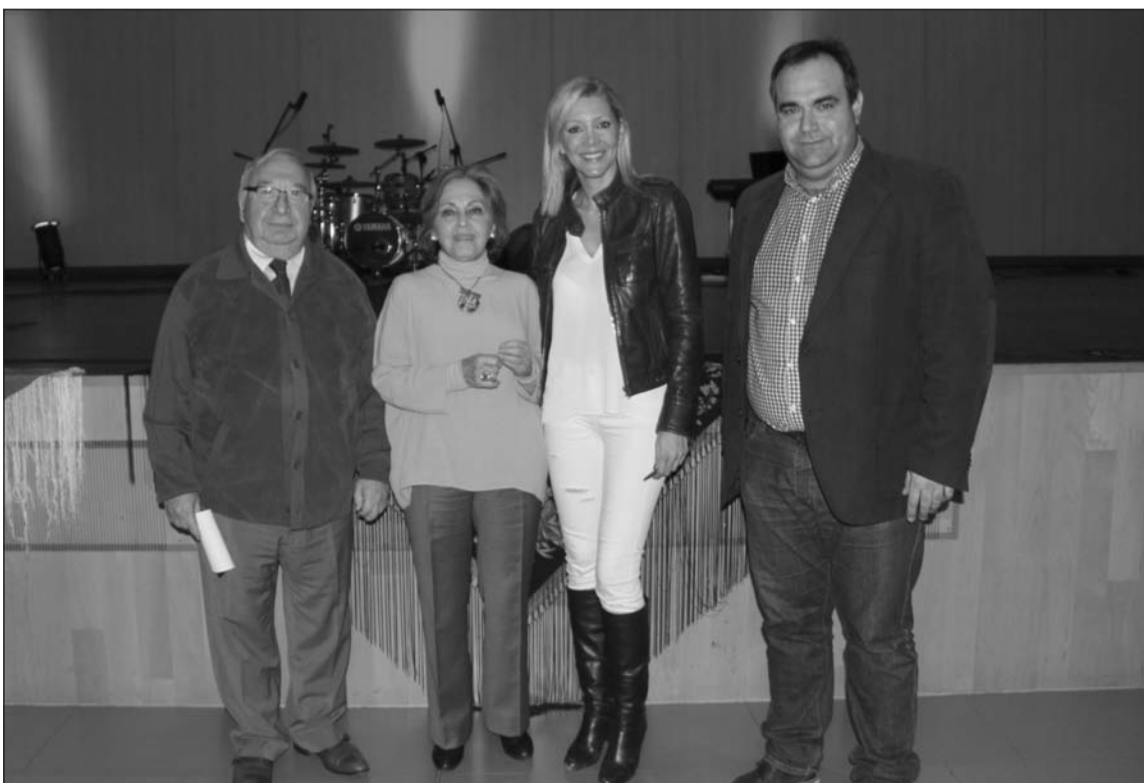
El presidente de la Federación de Peñas asistió al espectáculo, junto a otros invitados como la esposa del alcalde.