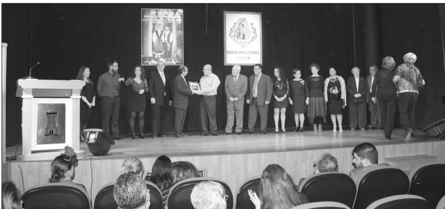
Un instante del acto de entrega de los Premios Alhaurinos del Año 2015 que se celebraba en el Centro Cultural Vicente Aleixandre.

Durante la velada, se sucedieron las diferentes actuaciones y espectáculos entre premio y premio, destacando la interpretación final del himno de Alhaurín de la Torre. Desde el año 1996, la Asociación Folklórico-Cultural Solera viene promoviendo los Premios 'Alhaurinos del Año' en colaboración con la Concejalía de Cultura del Ayuntamiento de Alhaurín de la Torre. Con estos galardones se quiere reconocer públicamente los méritos de los alhaurinos, residentes o no residentes, que con su trabajo por y para el pueblo de Alhaurín de la Torre lo potencian de una forma muy especial en sectores como la cultura, la educación, el deporte, el asociacionismo, el comercio, el turismo, la comunicación, etc., tanto a nivel personal, como socio-cultural y empresarial.