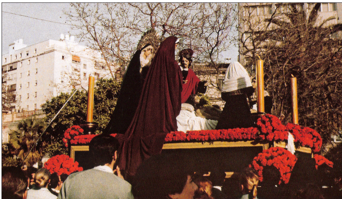
Primera salida del Monte Calvario por el recorrido oficial el Viernes Santo de 1982.