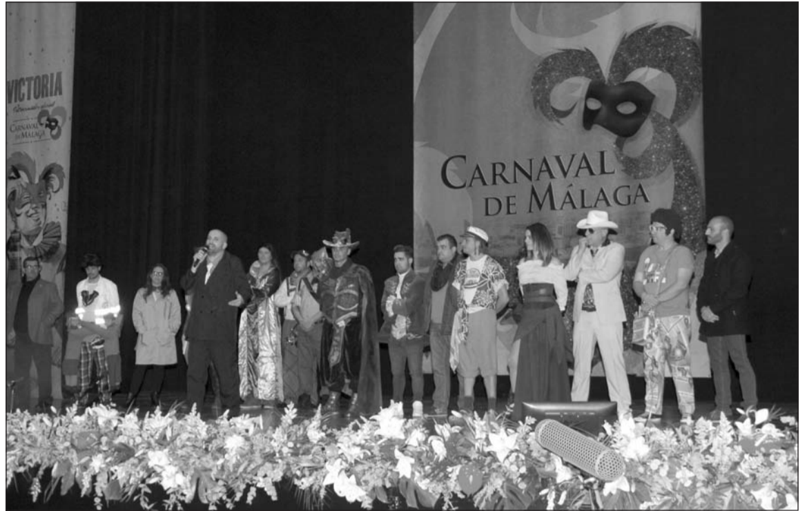
Directores de los diferentes grupos participantes en la final del concurso.

dor en el carnaval malagueño en los últimos años.