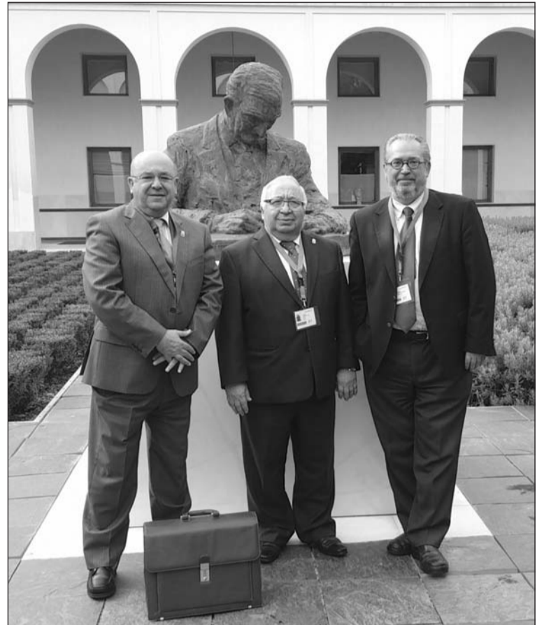
Representación peñista en el Parlamento de Andalucía.

Junto a estos dos puntos, la asamblea también intentará resolver diversas dudas de carácter administrativo y financieros que surgieron el pasado 25 de enero, contándose con la presencia de especialistas de la materia.