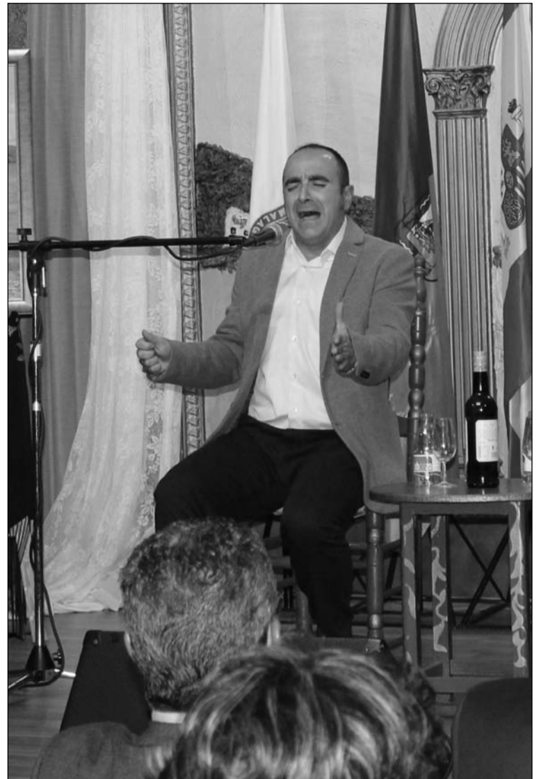
Uno de los cantaores participantes.

La primera de estas preliminares tenía lugar en la jornada del pasado día 9 de enero, teniendo continuidad los días 16 y 23. La junta directiva de la