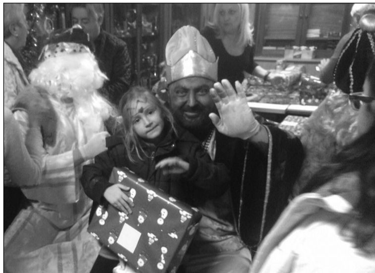
El Rey Gaspar, con una pequeña en la Peña Pedregalejo.

La Peña Recreativa Pedregalejo comenzaba el mes de enero con la fiesta de Reyes Magos, con regalos y merienda para todos los niños de la barriada; y lo cerraba invitando a todos sus socios gratuitamente a pasar un fin de semana en el Hotel Bahía Tropical de Almuñécar, siendo ésto un hermanamiento cariñoso entre todos los componentes.