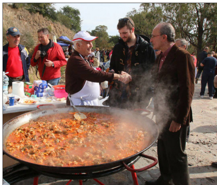
El alcalde saluda al cocinero de una de las paellas que se prepararon.

También colaboraron Empresarios Málaga Este, la Asociación de Mayores de El Palo, la Asociación de Amigos del Carnaval Paleño, Mar Abierto, Amfremar, el Club Deportivo El Palo-Pedregalejo de Fútbol Sala, la Asociación de Vecinos Rebalaje, la Asociación de Vecinos La Pelusa-Gálica, Aplem-España, o El Deshollinador de Málaga.