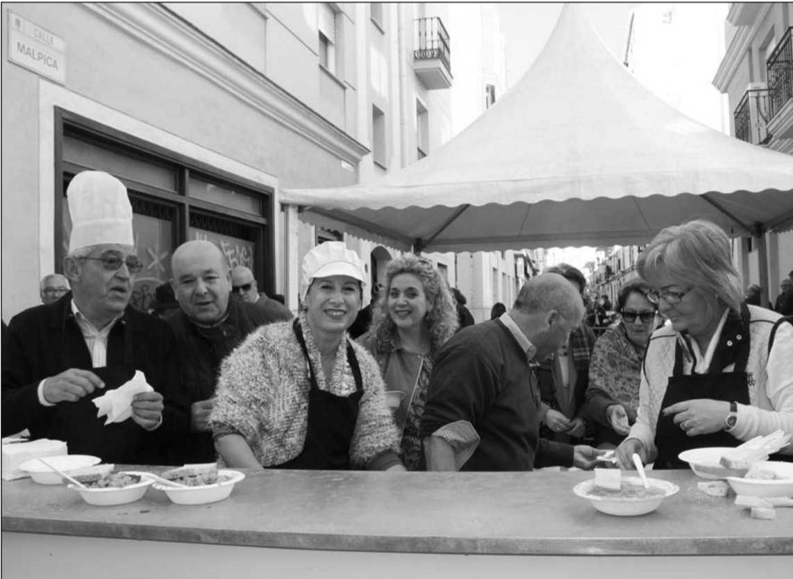
Reparto gratuito de raciones de potaje en la calle Malpica.