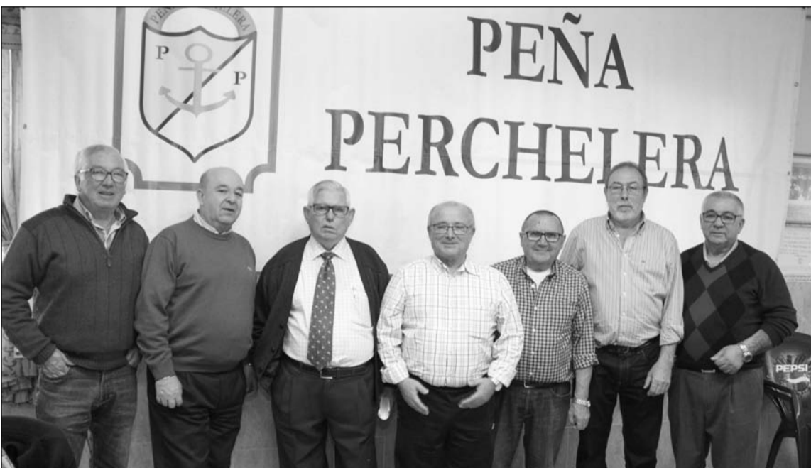
Peñistas y representantes vecinales en la sede de la Peña Perchelera.