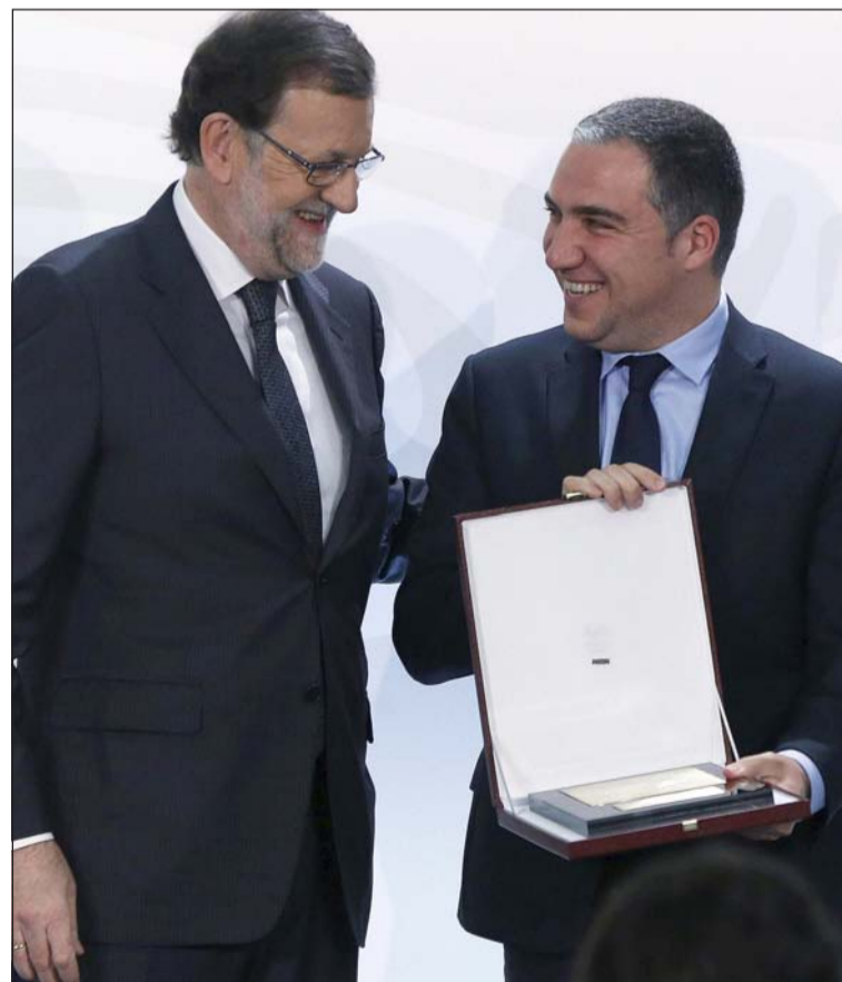
El Caminito del Rey ha obtenido la placa al mérito turístico en destinos emergentes.