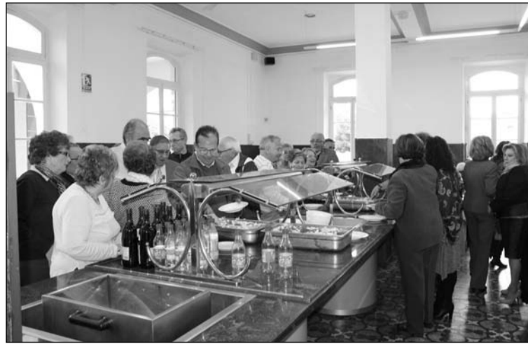
Participantes disfrutando del buffet servido en La Térmica.

Con esta comida, en la que los asistentes disfrutaron de un buffet, se inauguraban las actividades anuales de la Peña La Paz en este año 2016.