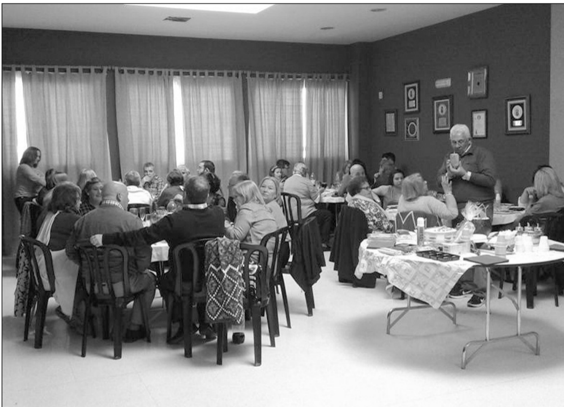
Imagen del almuerzo que compartieron los componentes de la pastoral de la Peña Santa Cristina.