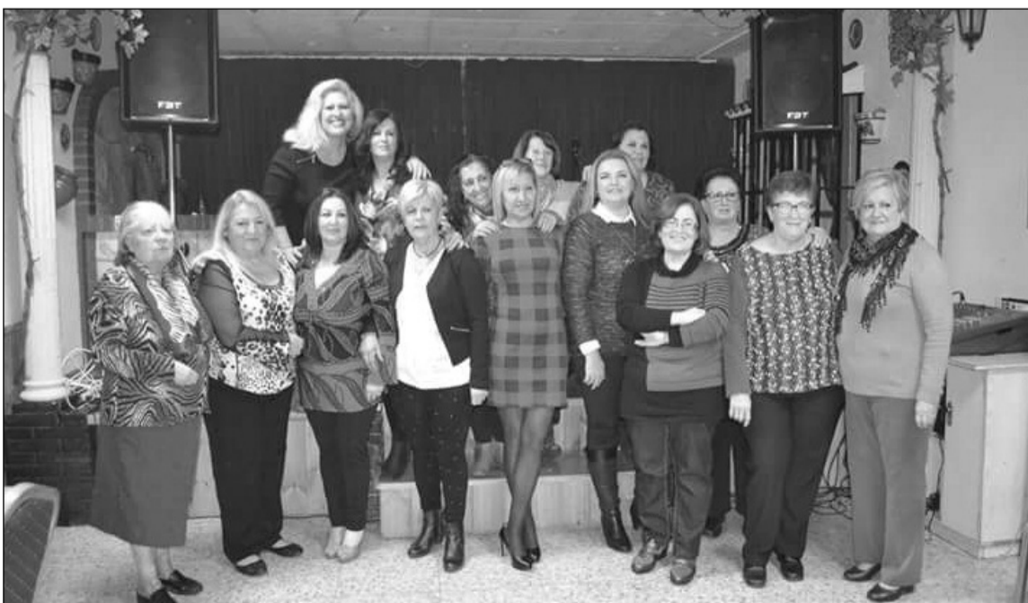
Un grupo de mujeres que participaron en esta actividad.