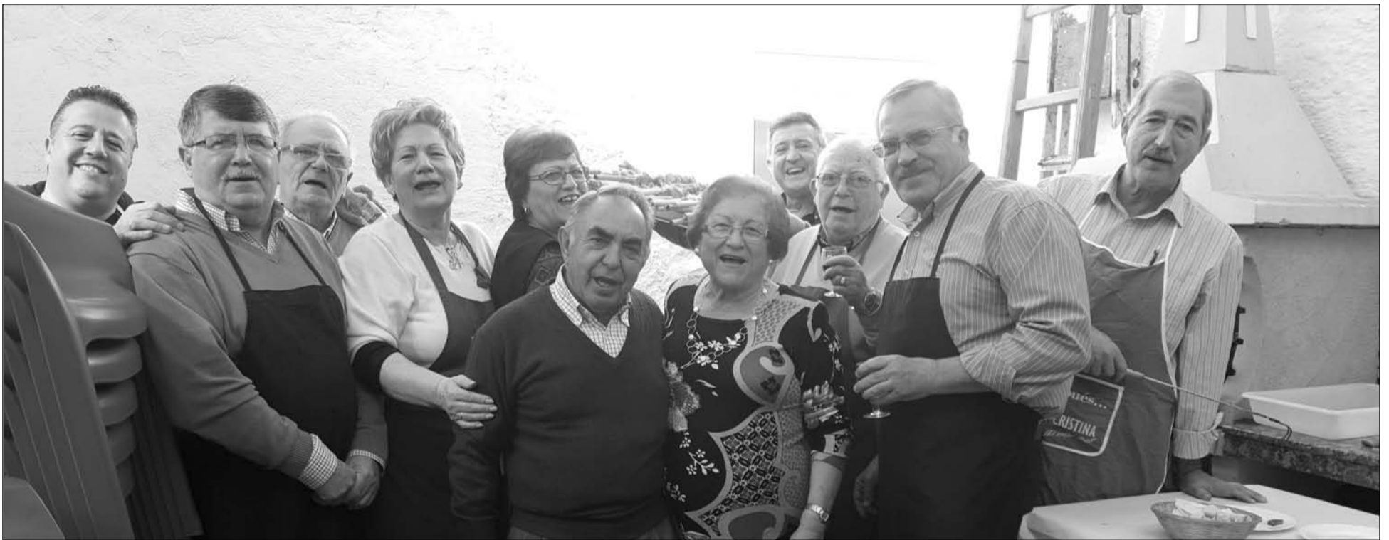
Socios de la Agrupación Cultural Telefónica ante una de las barbacoas empleadas durante esta jornada gastronómica.

Para terminar un buen postre, café, fútbol en televisión y departir tertulia en una tarde de temperatura casi primaveral.