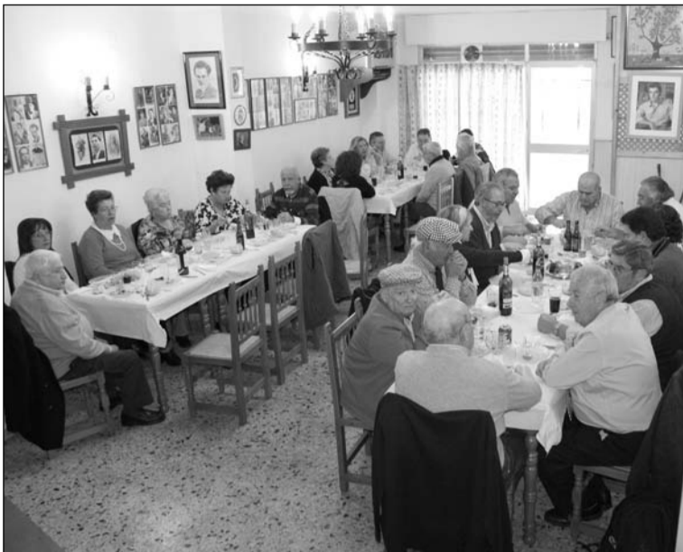
Socios degustan el almuerzo antes de disfrutar del espectáculo.