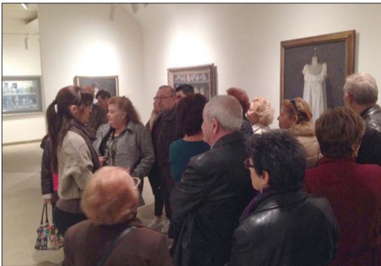
Peñistas contemplando una de las salas de la pinacoteca.