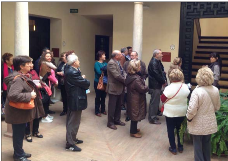
Inicio de la visita al Museo Revello de Toro.