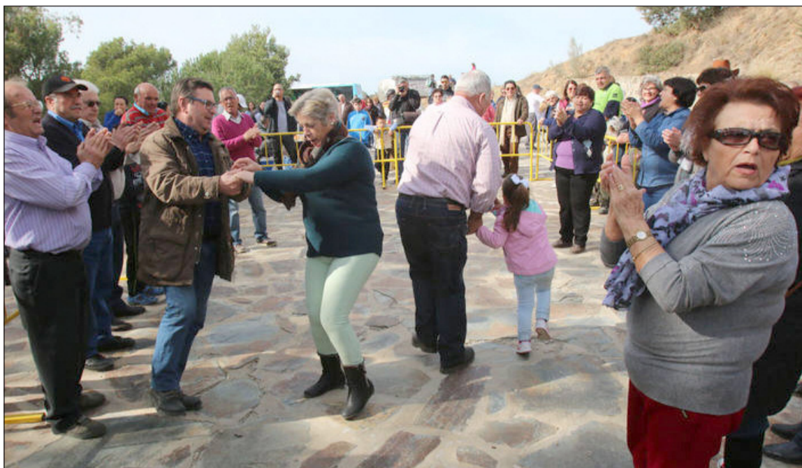
Baile de Maragatas durante la romería.