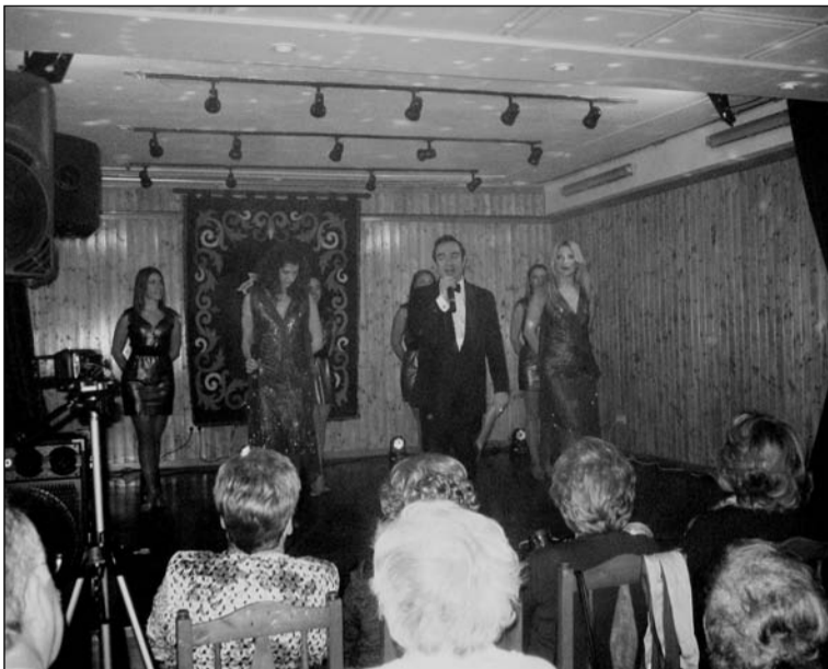
Representación de ABBA por la Compañía Teatro Lírico Andaluz.