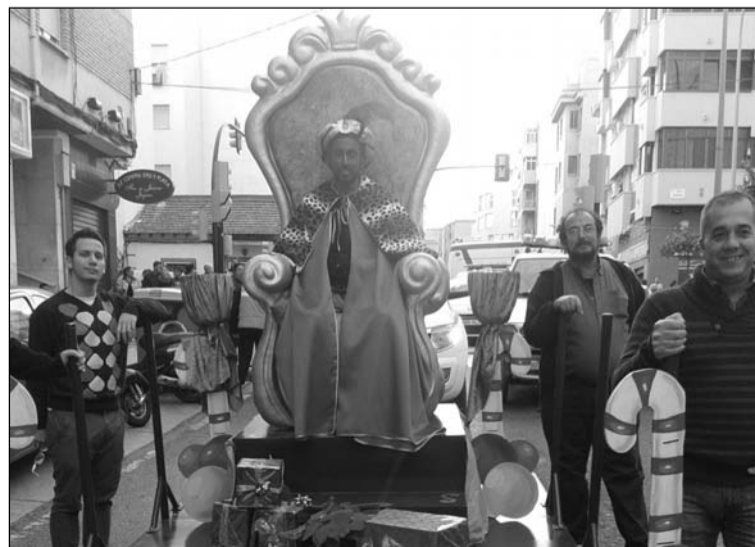
El Rey Baltasar, por las calles de la barriada.