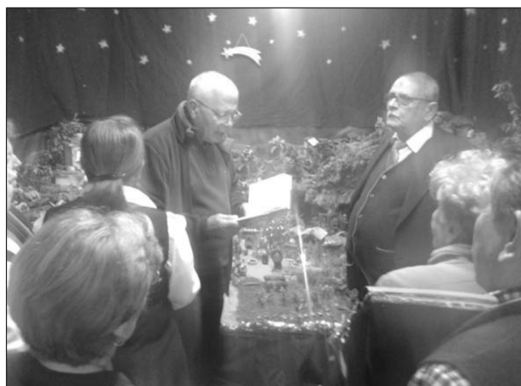
Acto de bendición del Belén.