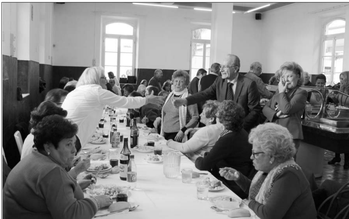
El alcalde saluda a los peñistas en presencia de la presidenta de la Peña La Paz.