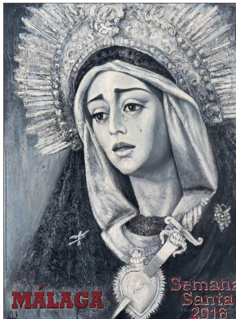
Cartel de la Semana Santa de Málaga 2016.