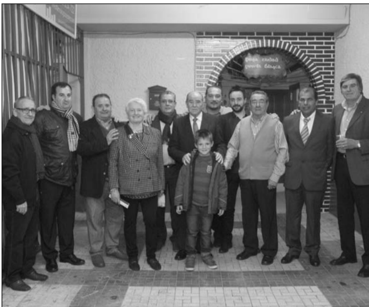
Imagen de grupo de la tercera preliminar del concurso.