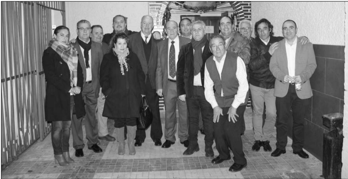
Participantes de la segunda de las semifinales con directivos de la Peña Ciudad Puerta Blanca e invitados.