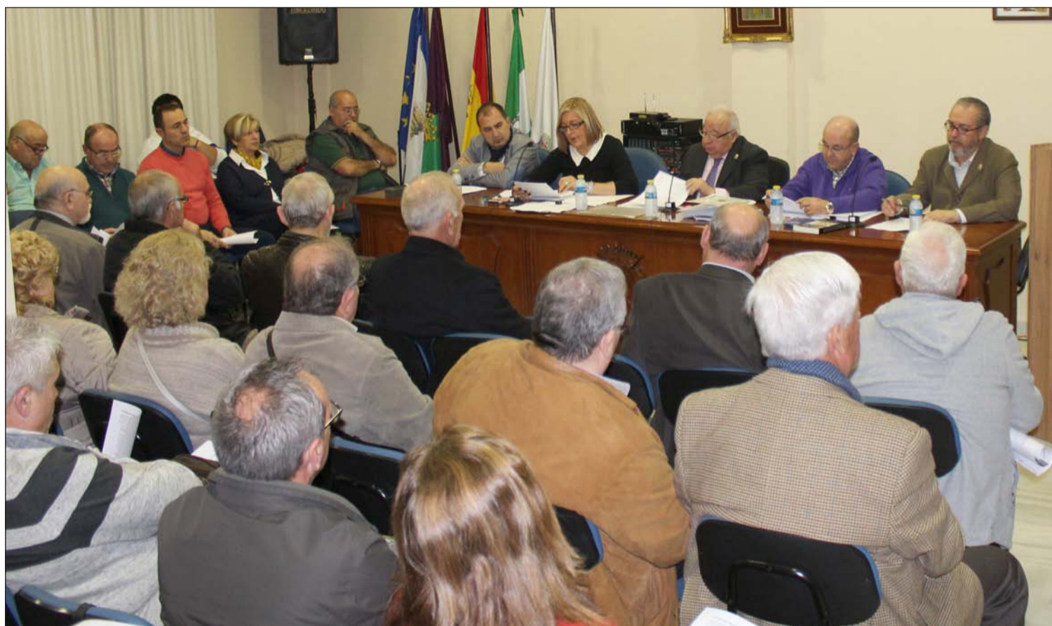
La Federación Malagueña de Peñas celebraba el pasado lunes su asamblea con la presencia de presidentes y representantes de las entidades que la componen.

Número 592 27 de Enero de 2016 C/ Pedro Molina, 1 Tfno: 952 22 54 39 Fax: 952 21 48 82 E-mail: prensa@femape.com - la_alcazaba@hotmail.com Web: www.femape.com Edición digital: www.femape.com/laalcazabadigital Twitter: @FMPLaAlcazaba Facebook: www.facebook.com/FMPLaAlcazaba