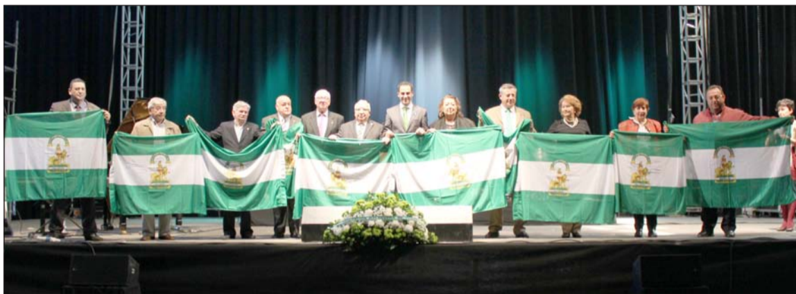
Entrega de banderas de Andalucía en la celebración del 28 de febrero del pasado año.