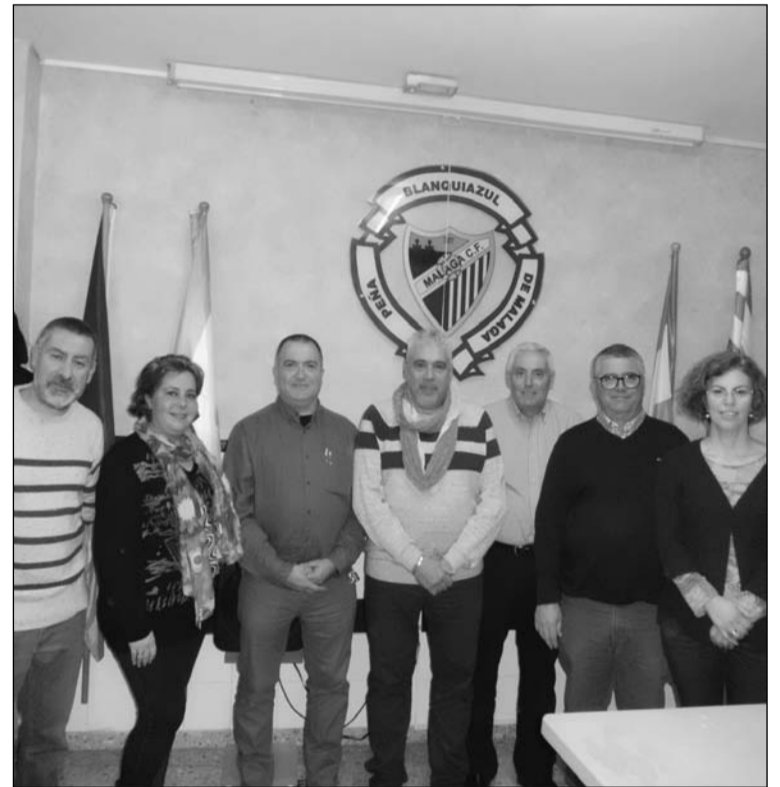
Junta directiva de la Peña Blanquiazul de Málaga.

Dentro de las actividades programadas para este mes de enero, el día 31 comenzarán los II Juegos de Peñas que en esta ocasión serán en la modalidad de dominó.