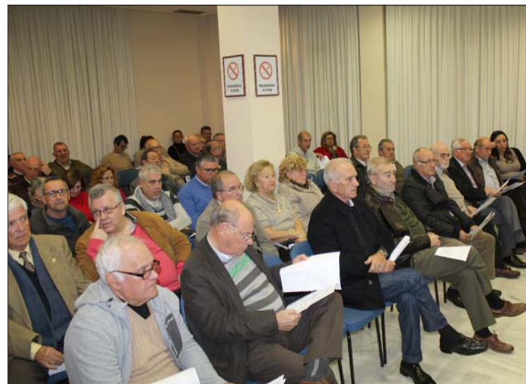
Asistentes a la asamblea durante la exposición de uno de los puntos del día.

TESESA Diseño y Fabricación de Puertas, Armarios y Parquet