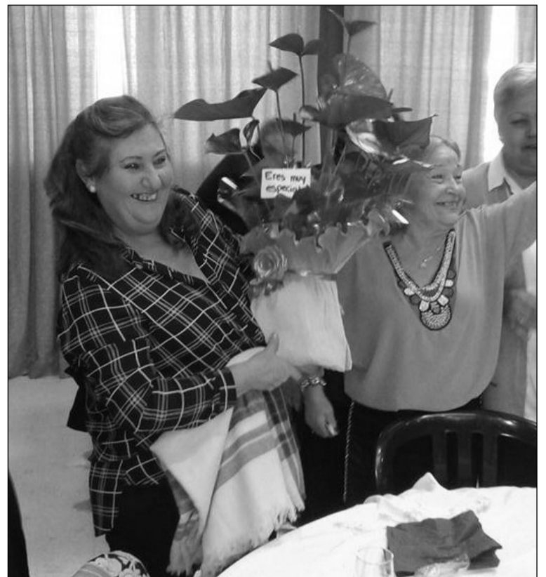
Entrega de un recuerdo a la presidenta de la entidad.

por toda la capital y otros puntos de la provincia; entre ellos el XVII Encuentro de Pastorales 'Memorial José María Martín Carpena' que el pasado 20 de diciembre organizaba la Federación Malagueña de Peñas, Cen-