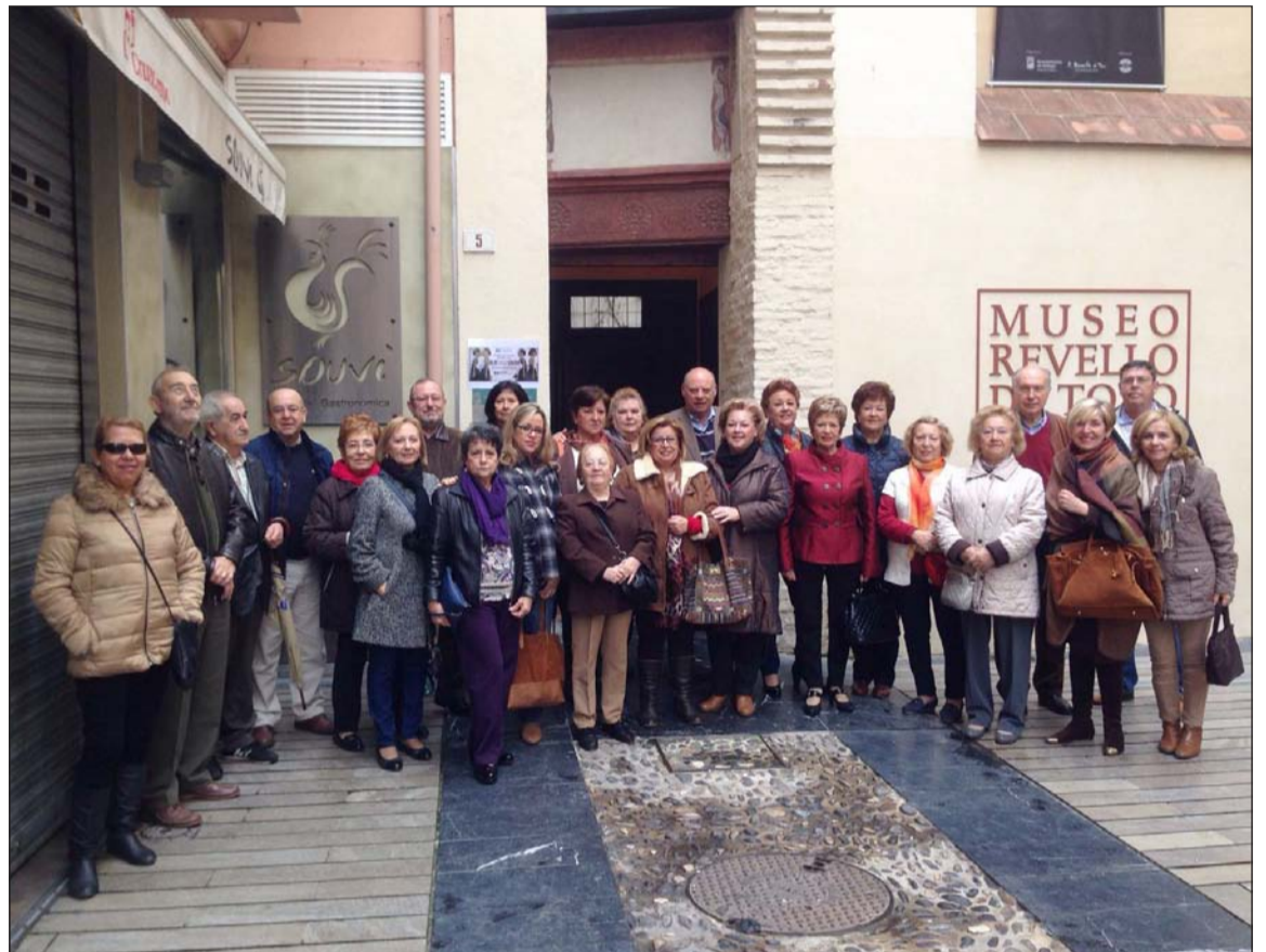
Grupo organizado por la Federación Malagueña de Peñas para visitar el museo.