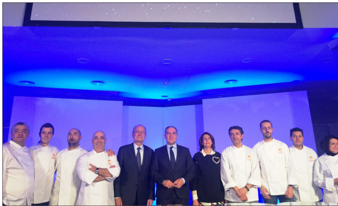
Cita gastronómica en Madrid con La Noche de las Estrellas.

Lo que sí ha experimentado un ligero descenso (-0,6 por ciento) durante 2015 con respecto al año anterior fueron los viajeros naciona-