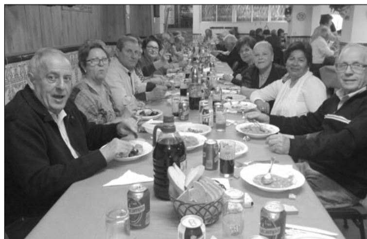
Comida navideña del 19 de diciembre.