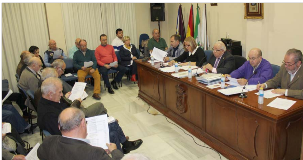
Un instante de la Asamblea General Ordinaria celebrada el pasado lunes.