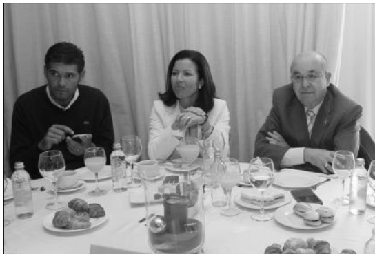
La Federación de Peñas estuvo invitada al foro y fue representada por su vicepresidente.