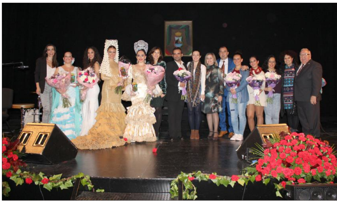
Los artistas que protagonizaron la clausura de Málaga Cantaora el pasado 8 de diciembre en el Cervantes, con autoridades y miembros de la Federación de Peñas.

Número 589 16 de Diciembre de 2015 C/ Pedro Molina, 1 Tfno: 952 22 54 39 Fax: 952 21 48 82 E-mail: prensa@femape.com - la_alcazaba@hotmail.com Web: www.femape.com Edición digital: www.femape.com/laalcazabadigital Twitter: @FMPLaAlcazaba Facebook: www.facebook.com/FMPLaAlcazaba