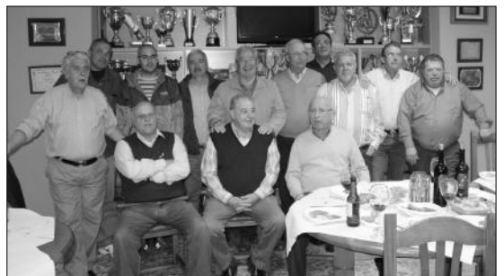
Componentes del equipo de dominó de esta entidad federada.