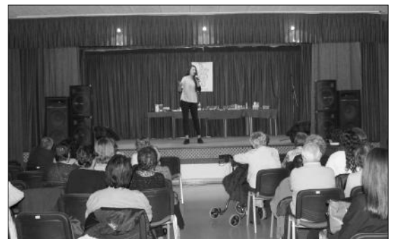
Numerosos aficionados a la copla quisieron colaborar con esta Gala del Kilo.