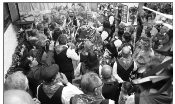
Interpretación de villancicos ante el belén de la Peña El Palustre.