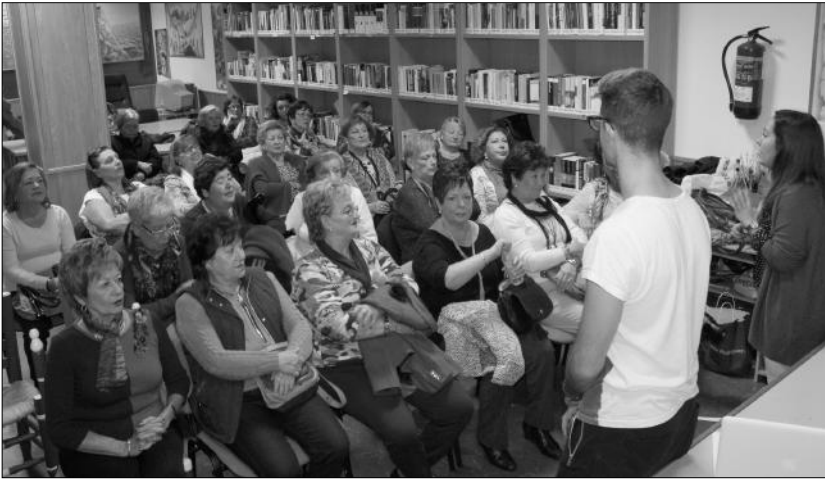
Un instante de la tercera de las charlas impartidas el pasado 3 de diciembre en la sede de la Casa de Álora.