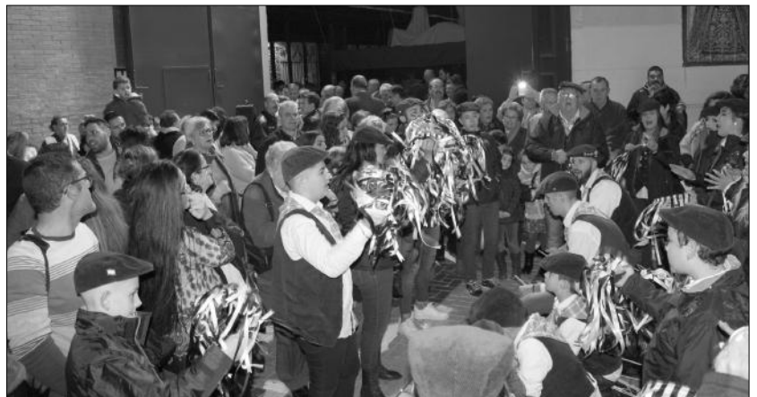
Actuación de una de las pastorales que acudieron a la inauguración del Belén de esta cofradía del Jueves Santo.

El acuerdo de colaboración alcanzado entre la Agrupación de Cofradías de Semana Santa y la Federación Malagueña de Peñas, Centros Culturales y Casas Regionales 'La Alcazaba' está posibilitando que diferentes pastorales estén actuando en esta Navidad en las inauguraciones de los belenes de las hermandades, como el instalado en la Casa Hermandad de la Cofradía de Zamarrilla.