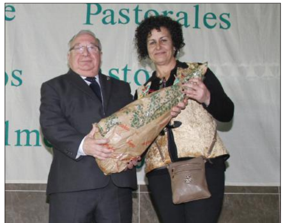
Cada una de las agrupaciones participantes recibió un jamón de obsequio.

Una de las pastorales participantes en el Encuentro de Pastorales de Colmenarejo.