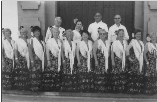
Imagen del Coro Jazmines Malagueños de la Peña El Seis Doble.

La Peña El Seis Doble, que tiene su sede en la calle Jamaica del Dis-