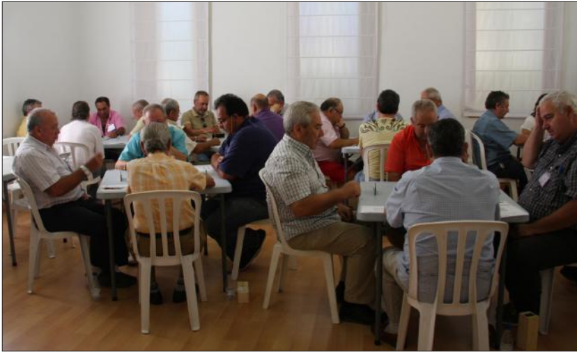
Competición de dominó durante las IX Olimpiadas de Juegos de Peñas celebradas en el año 2014.

Conocido como 'El Primo', Rafael Fuentes Aragón fue hasta su muerte en 2005 presidente adjunto de la Federación Malagueña de Peñas, y uno de los hombres más queridos y respetados del colectivo. Estas Olimpiadas son el tributo que le prestan, en su memoria, los peñistas malagueños.