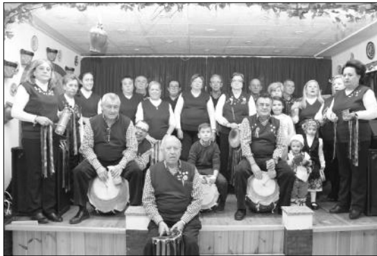
Los villancicos regresaron un año más a la sede de la Peña El Parral.

Un día después estaba prevista la inauguración del Belén de esta entidad integrada en la Federación Malagueña de Peñas, Centros Culturales y Casas Regionales 'La Alcazaba', coincidiendo con la elaboración de los tradicionales borrachuelos.