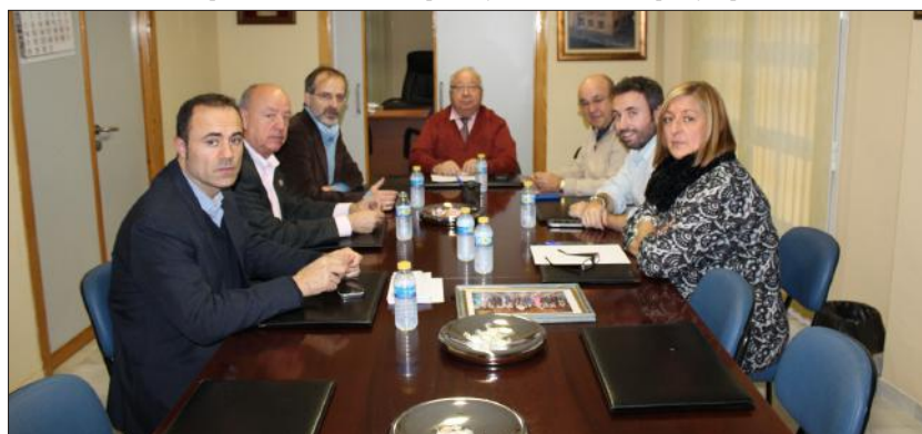
Un instante de la reunión mantenida en la sala de juntas de la Federación Malagueña de Peñas.