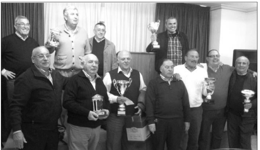
Representantes de la Sociedad Excursionista con los premiados tras el acto de entrega de trofeos.