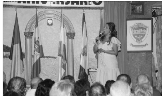
Noche de Copla vivida en la sede de la Peña Ciudad Puerta Blanca.

El colofón a estos actos fue el sábado 5 de diciembre con una cena de gala en el restaurante Pórtico de Velázquez; mientras que el domingo se hacía entrega de trofeos de los torneos disputados y el lunes 7 concluyeron los actos con una misa de difuntos en la parroquia.