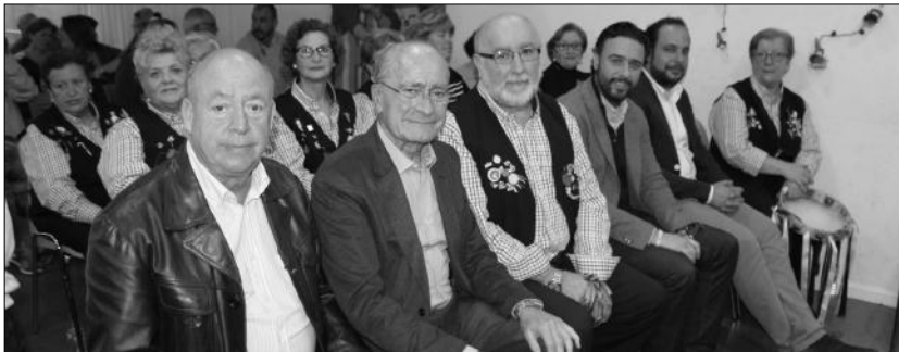
Autoridades presenciando el Encuentro de Pastorales celebrado en la sede de la Asociación de Vecinos Zona Europa.