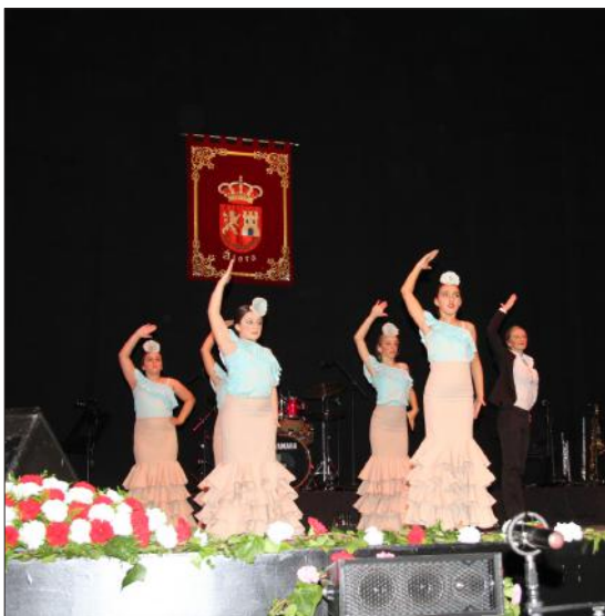
El baile también tuvo cabida en el seno de un gran espectáculo.