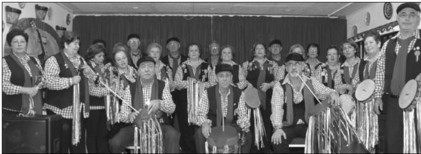
Componentes de una de las pastorales participantes en el encuentro celebrado en la Peña El Parral