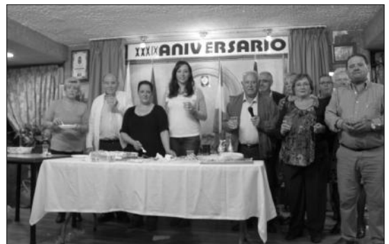
Brindis por la Peña en el cierre de los actos conmemorativos del Aniversario.