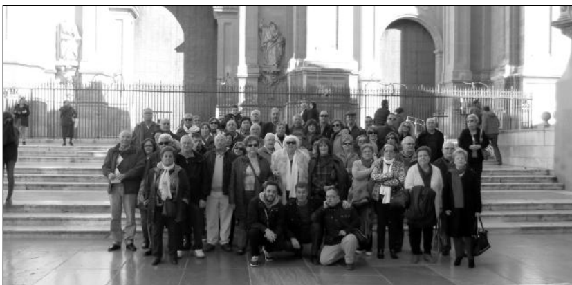
Grupo de socios de la Agrupación Cultural Telefónica ante la catedral de Granada.

Tras la parada restauradora, se llevó a cabo la visita casi obligada a la histórica población de Santa Fe para la compra de los afamados dulces Piononos y de vuelta a Málaga, después de haber gozado de una espléndida jornada en su contenido y también meteorológicamente.