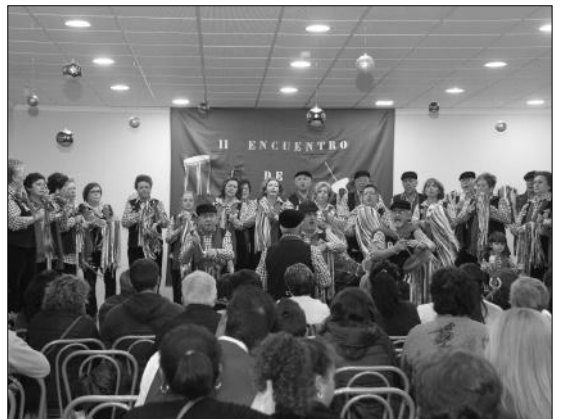
Actuación de una de las agrupaciones participantes.