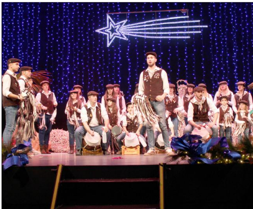
Actuación de la Pastoral de la Peña Los Penosos durante el Encuentro del pasado año en el Teatro Cervantes.

Desde la organización se recuerda que la Pastoral que no esté en el lugar y hora que se le sea asignado, no tendrá derecho a actuar en el escenario del Teatro Cervantes.