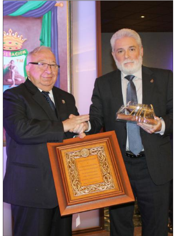
Los presidentes de las federaciones peñistas de Málaga y Córdoba.

Las actas de hermanamiento fueron firmadas en presencia de los alcaldes de ambas capitales,