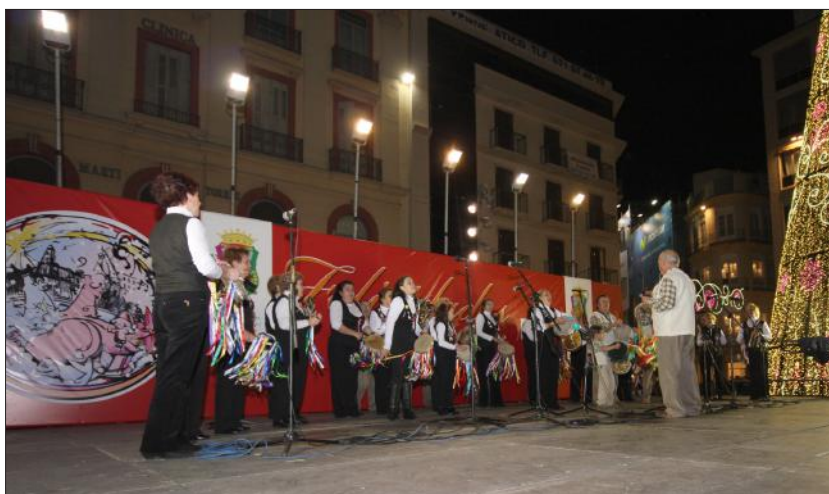
Imagen de archivo de una de las pastorales actuando en la plaza de la Constitución durante una edición anterior del encuentro.