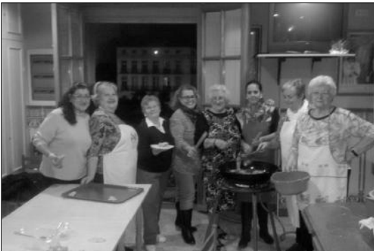
Borrachuelada celebrada el 9 de diciembre en la Peña Recreativa Trinitaria.