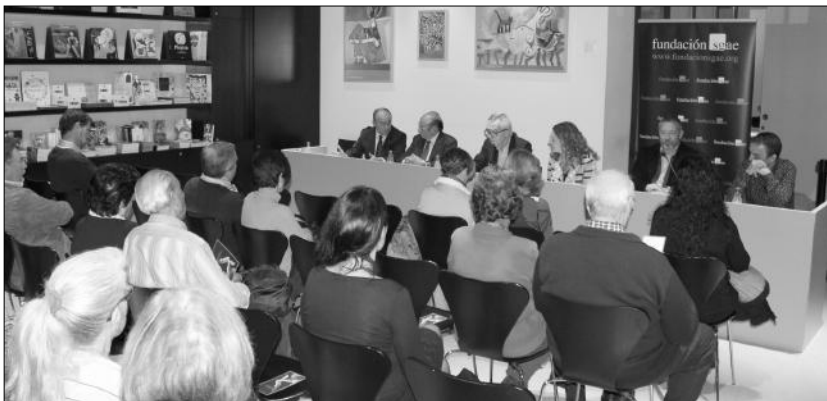
El coloquio despertó un gran interés en la Sala Librería del Museo Picasso Málaga.