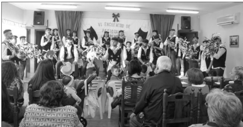
Un instante del encuentro de pastorales celebrado en el interior de la sede de Los Penosos.