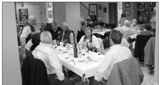
Imagen de la comida de hermandad celebrada en la sede de la Peña La Rosaleda.

que no faltaron los componentes de su equipo de dominó, que en este año 2015 han logrado importantes logros en las competiciones en las que han participado.