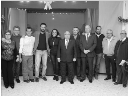
Asistentes al acto de inauguración del Belén de la Peña Costa del Sol.