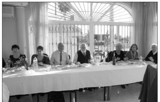
Mesa presidencial de la comida celebrada con motivo de las fiestas navideñas.

Venta El Túnel de nuestra capital. Numerosos socios disfrutaron de este almuerzo en el que se desearon unas felices fiestas.