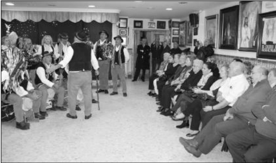
La Pastoral del Centro Cultural Renfe actuó en la inauguración del Belén.