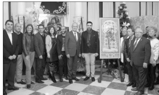
Acto de presentación del cartel del Carnaval en el Salón de los Espejos.