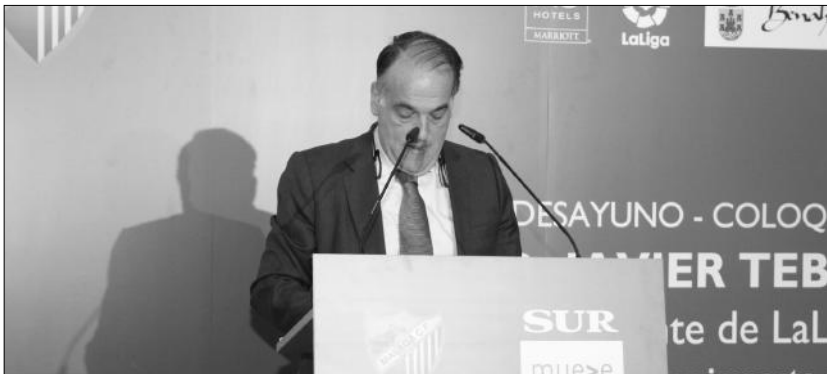
Intervención de Javier Tebas, presidente de la Liga de Fútbol Profesional en el hotel AC Málaga Palacio.