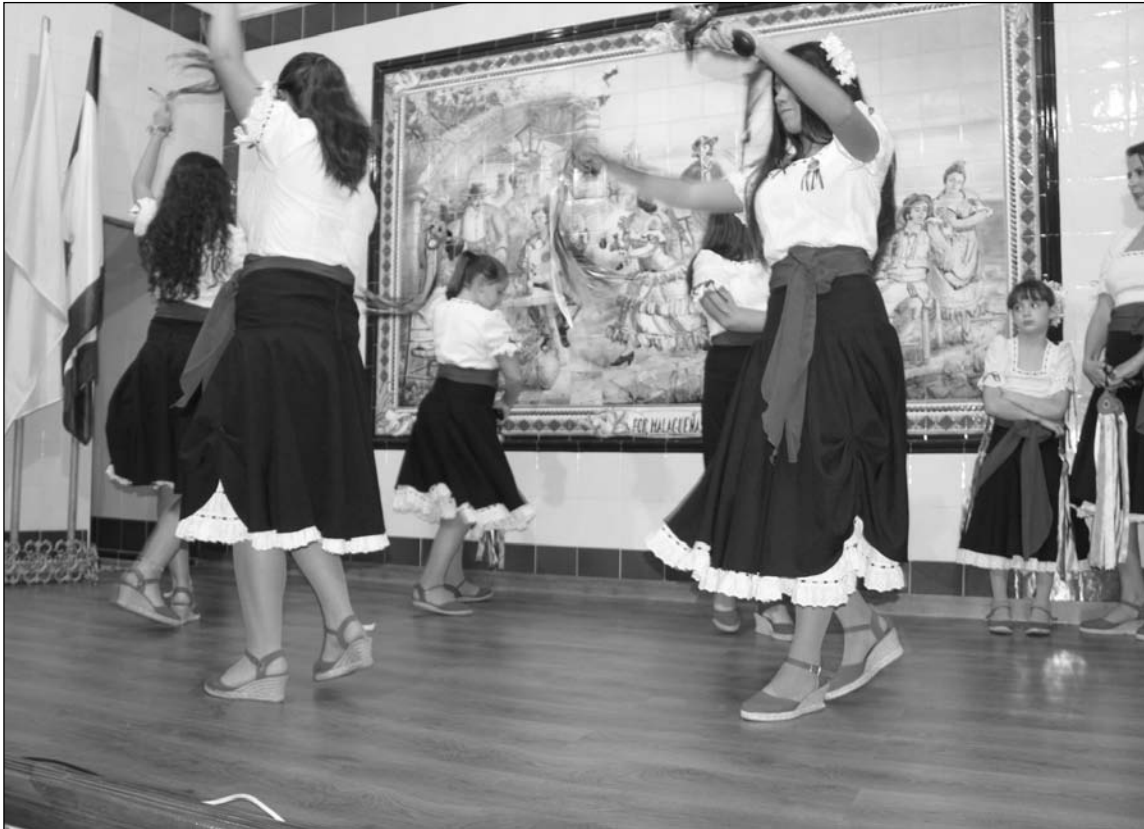
Baile por verdiales en la tercera de las semifinales.