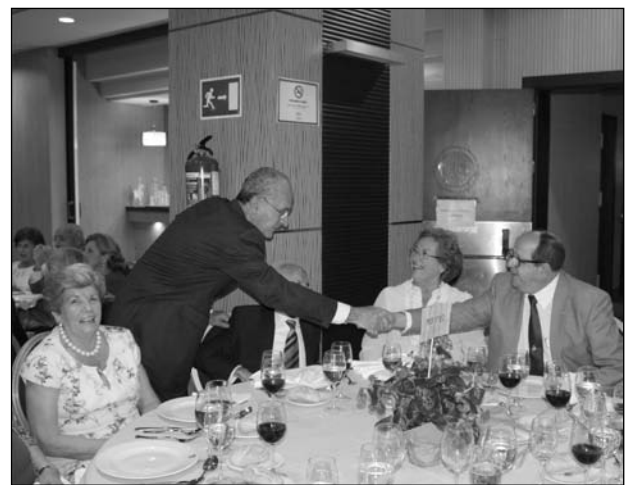
El alcalde saludó a todos los asistentes.