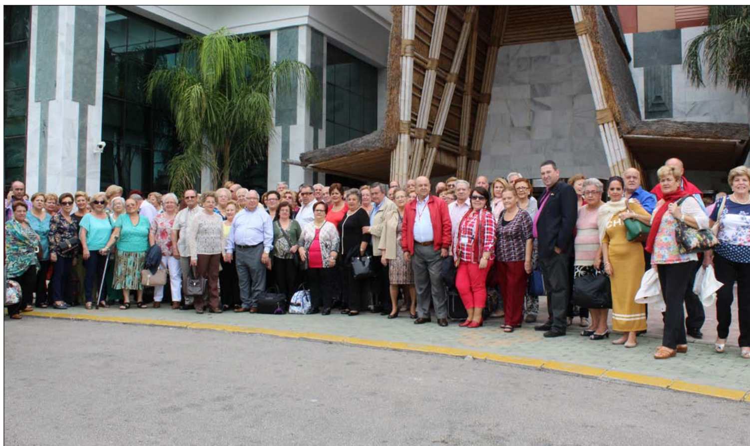
Participantes en el Día del Mayor 2015 en la entrada del hotel Polynesia del complejo Holiday World de Benalmádena.

Número 586 4 de Noviembre de 2015 C/ Pedro Molina, 1 Tfno: 952 22 54 39 Fax: 952 21 48 82 E-mail: prensa@femape.com - la_alcazaba@hotmail.com Web: www.femape.com Edición digital: www.femape.com/laalcazabadigital Twitter: @FMPLaAlcazaba Búsquenos también en Facebook