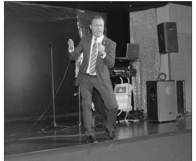
Antonio Montilla, cantando sobre el escenario.