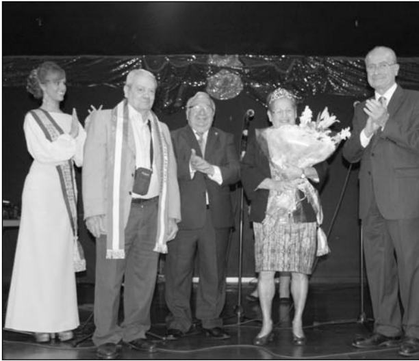
Reconocimiento a los Mayores del Año 2015.