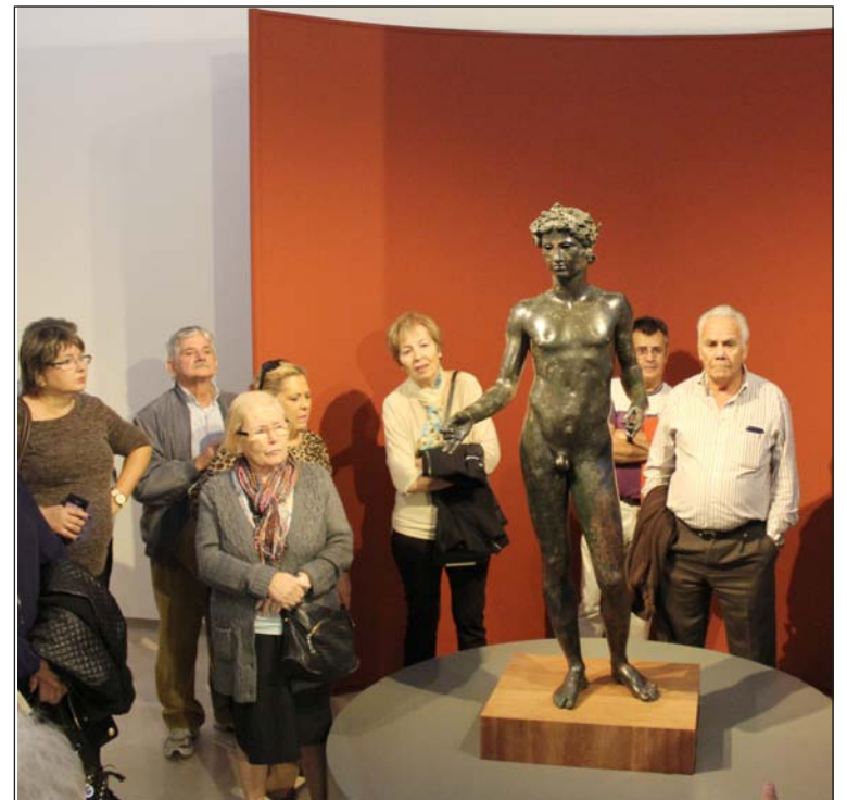
El Efebo de Antequera, en el Museo de la Ciudad.

Hay cosas que son exclusivamente malagueñas