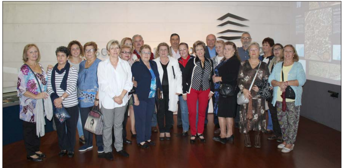
Grupo preparado para iniciar la visita.

Tras la visita, los participantes compartieron un aperitivo servido en la propia sede de la Federación Malagueña de Peñas.