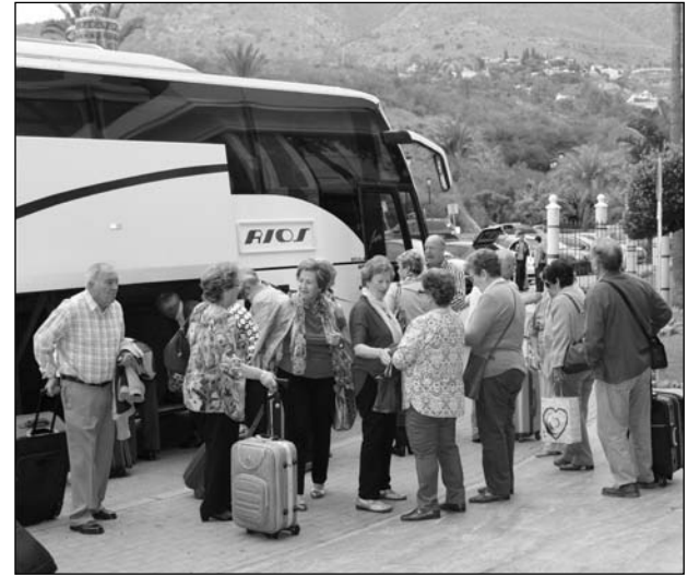
Llegada al hotel.