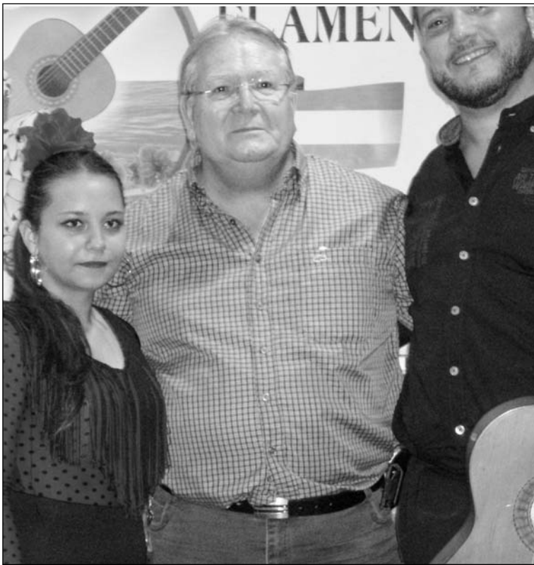
El presidente, con los artistas.