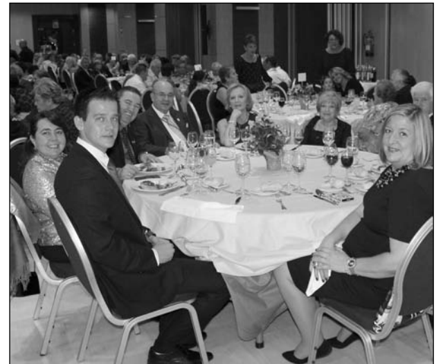
Mesa con directivos de la Federación y patrocinadores.