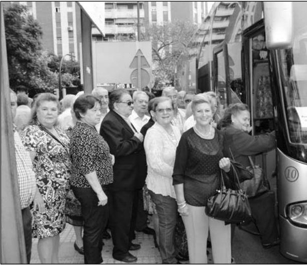
Los participantes fueron trasladados en autobús.