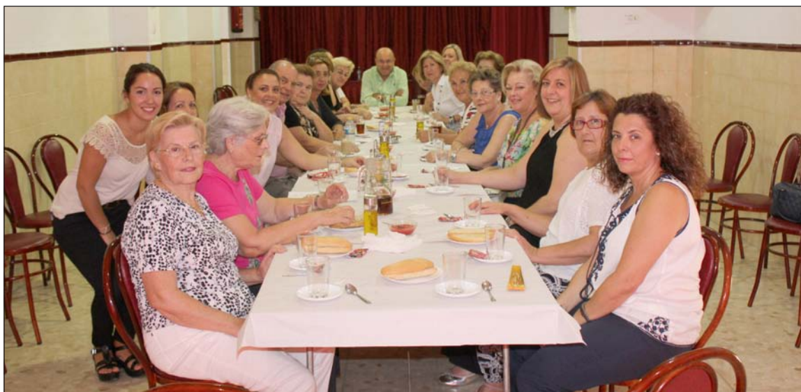
Merienda saludable tras la primera jornada del taller.

Este no será el único curso impulsado durante los próximos meses desde la Federación Malagueña de Peñas, que está realizando una importante apuesta formativa en los últimos meses.