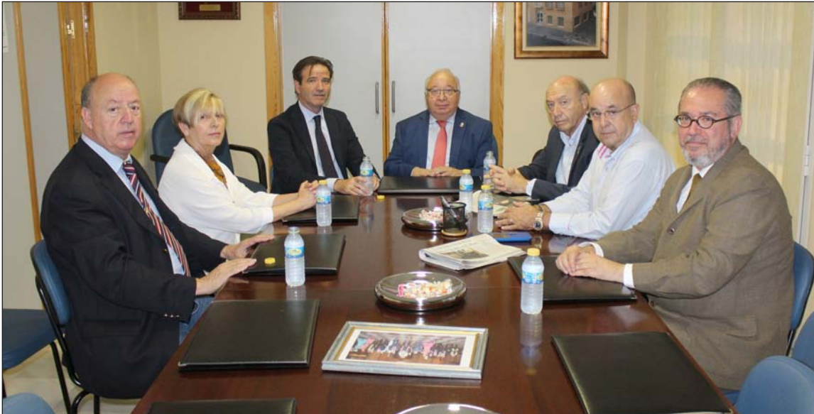
Un instante de la reunión mantenida en la sala de juntas de la Federación de Peñas.