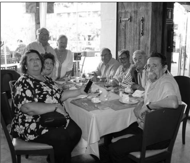
Participantes disfrutando del almuerzo.