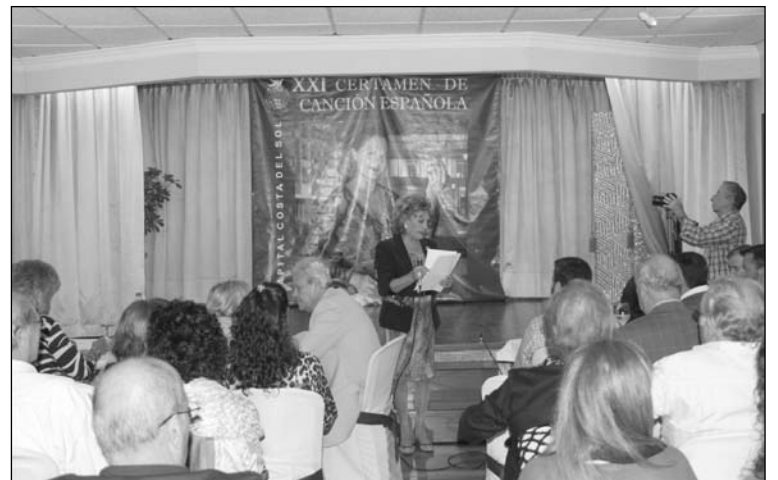
La presidenta se dirige a los asistentes a la semifinal.