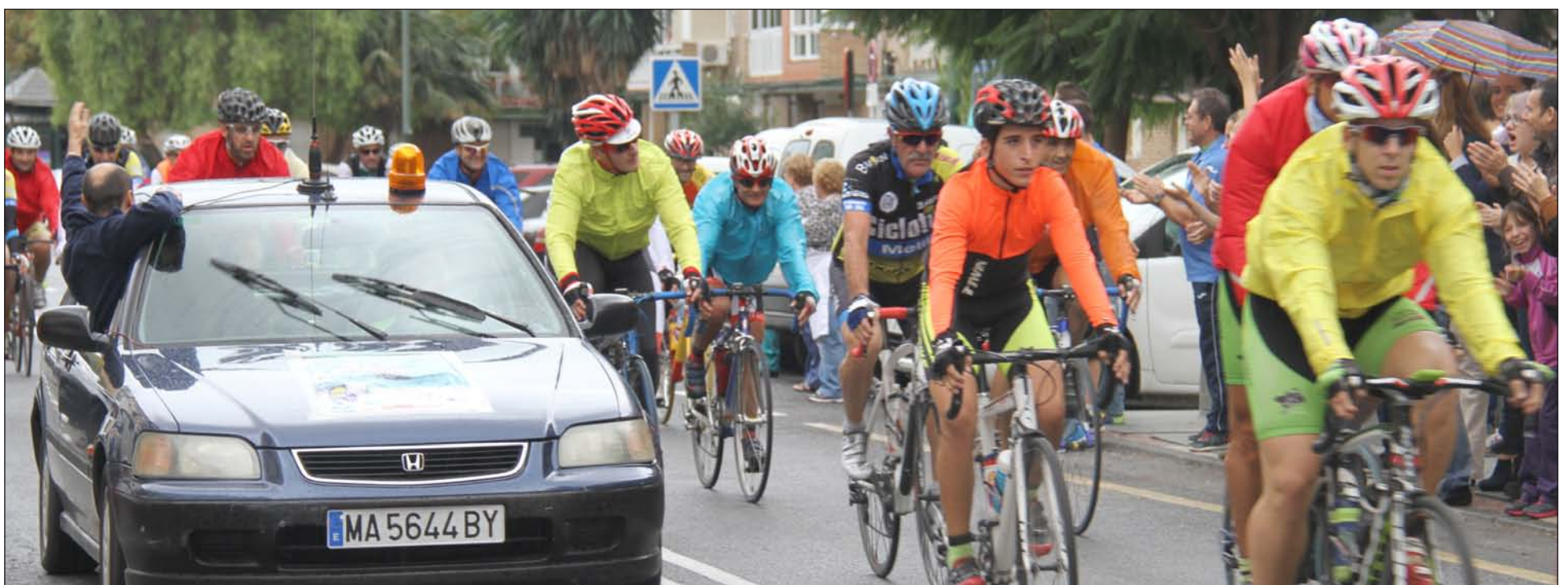
Ciclistas saliendo de Puerta Blanca.