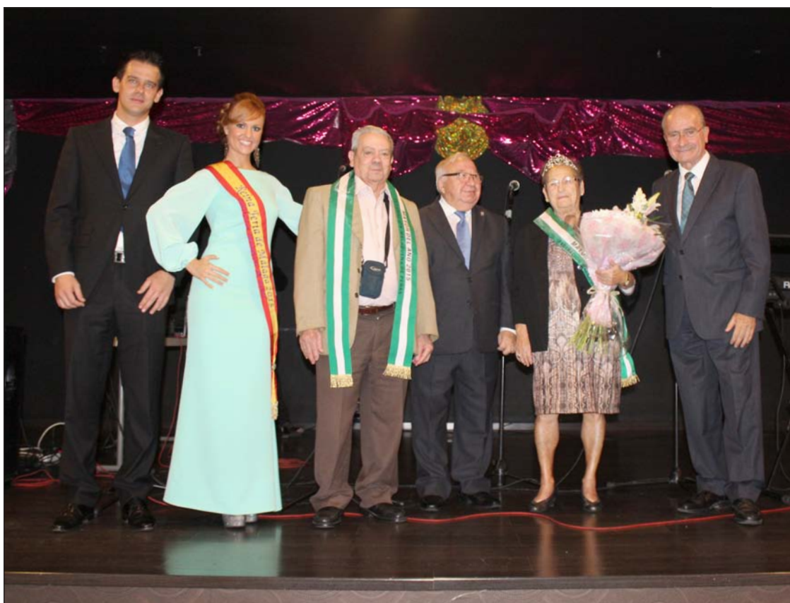
Nombramiento de los Mayores del Año en presencia del alcalde, Francisco de la Torre.