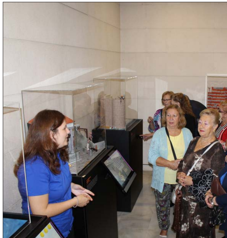
Un instante de la visita.