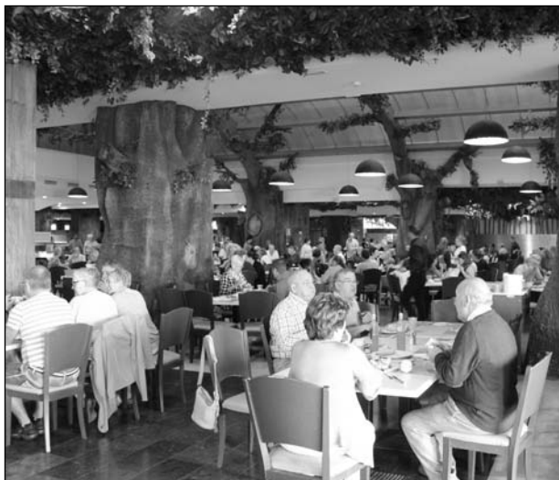
Vista general del buffet del hotel Polynesia.