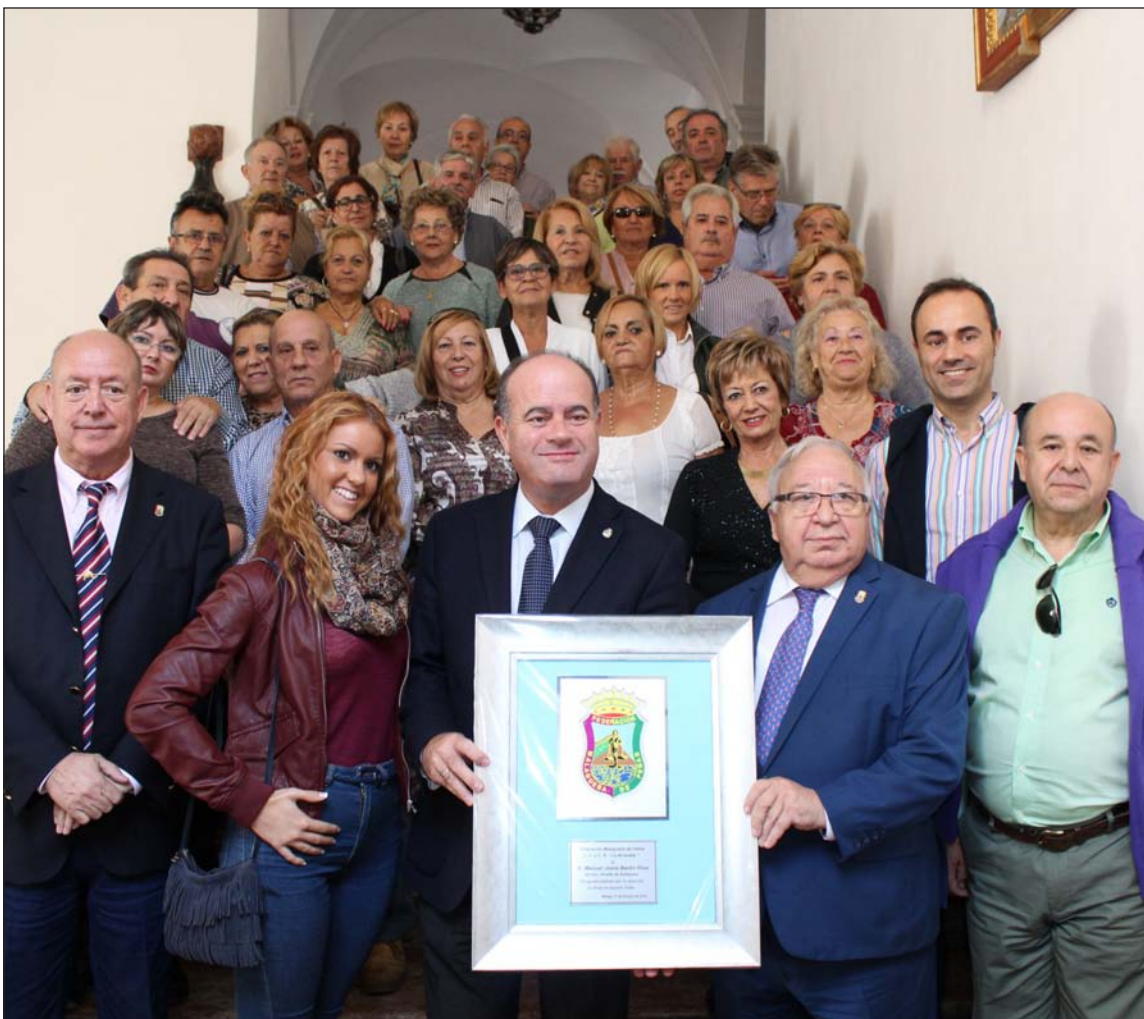
Peñistas junto al alcalde en la escalera del Ayuntamiento.

Fue en la entrada de Menga donde todos los participantes posaron realizando un gesto con las manos que, a través de la campaña 'Piedra sobre Piedra', viene a mostrar la adhesión a la candidatura antequerana, que unifica tanto estos dos dólmenes y el tolos de El Romeral, como la cercana Peña de los Enamorados y el singular Tor-