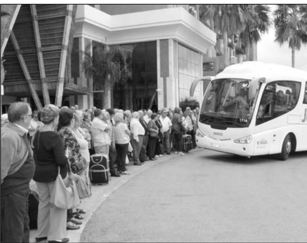
Regreso en autobús.