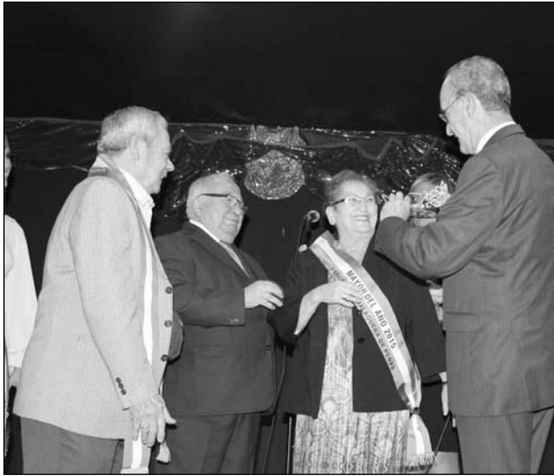
El alcalde corona a la mayor del año.