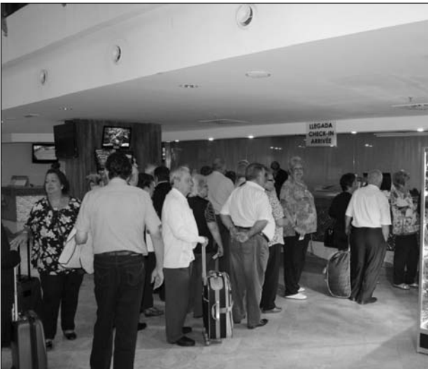
Entrega de llaves de las habitaciones.