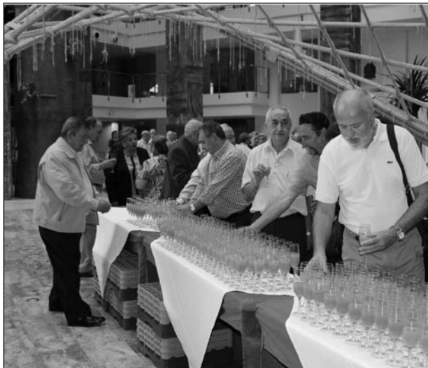
Copa de bienvenida en el hall del hotel.