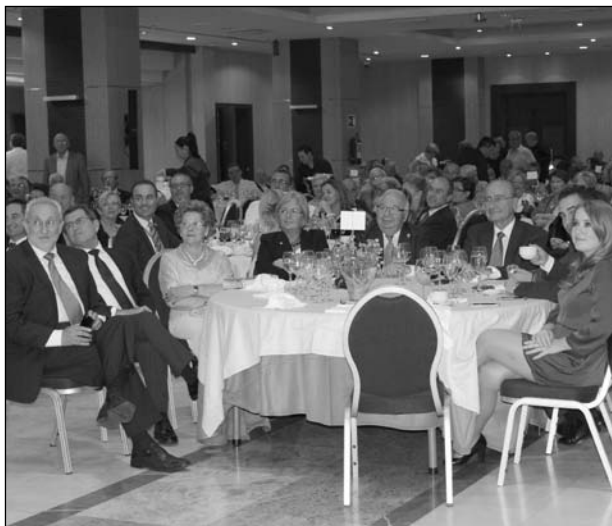
Mesa presidencial, presenciando el espectáculo.