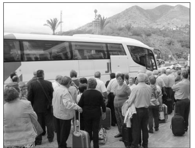
Los mayores disfrutaron de 24 horas completas de diversión.