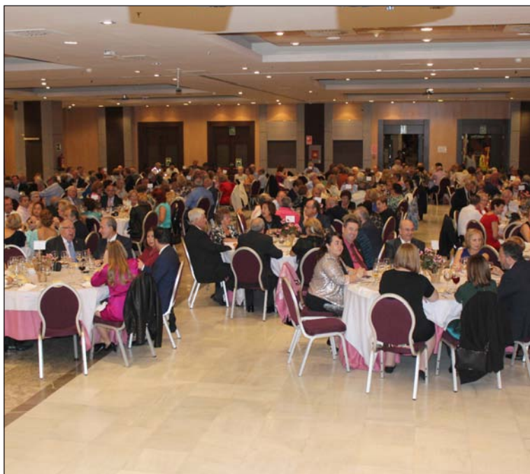
Imagen del salón durante la cena de gala.