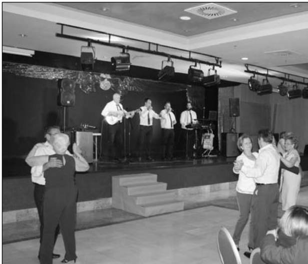
Algunos de los asistentes, bailando pasodobles.