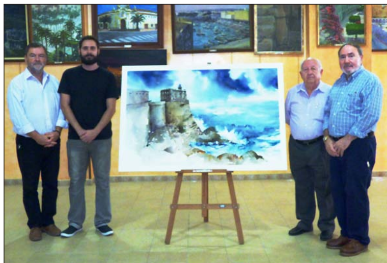
Los miembros del jurado, con la obra ganadora.