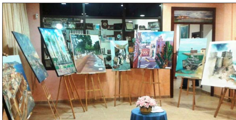
Muestra de trabajos presentados.