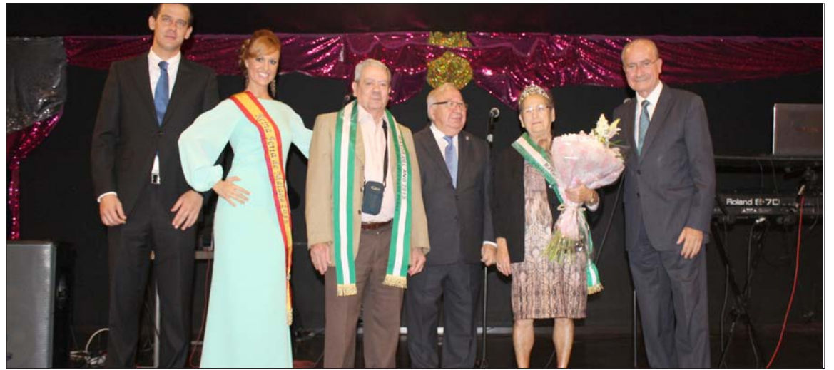
Reconocimiento a los mayores del año.