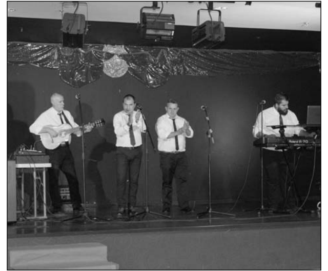
El grupo Gloria Bendita amenizó la velada.