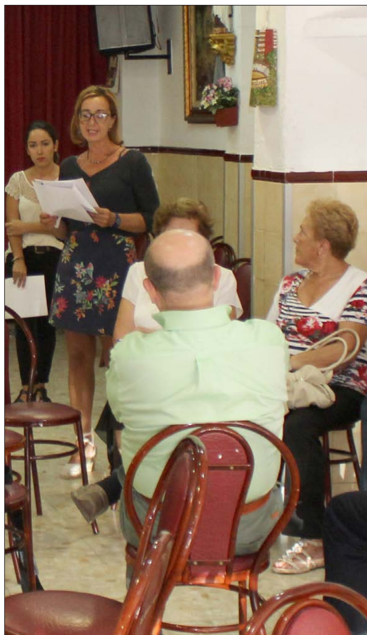
Instante del taller celebrado con anterioridad en la Peña Costa del Sol.

Entidades colaboradoras con esta publicación: