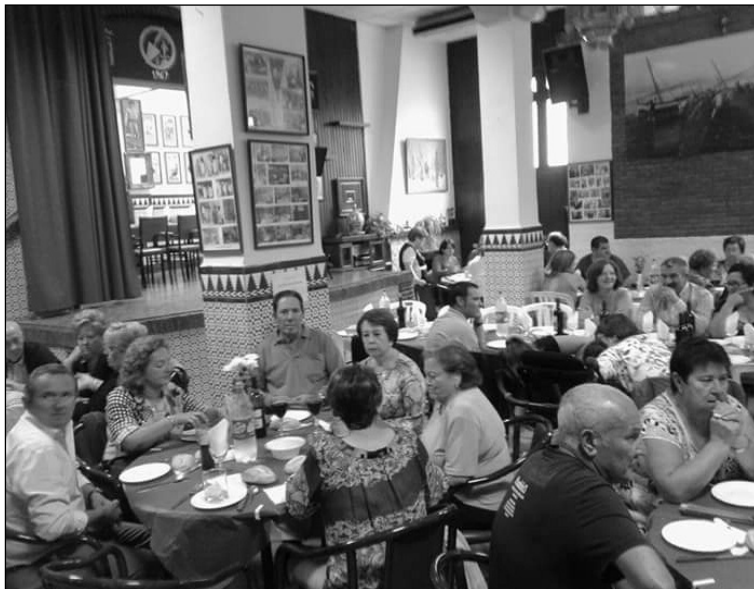
Aspecto que presentaba la sede.

Fue un día para la historia de esta entidad perteneciente a la Federación Malagueña de Peñas, Centros Culturales y Casas Regionales 'La Alcazaba', la cual agradece a la Asociación Malagueña Síndrome de Rett su atención y energía en este proyecto desde el mismo momento en el que se le propuso; manteniendo sus puertas abiertas para lo que necesiten.