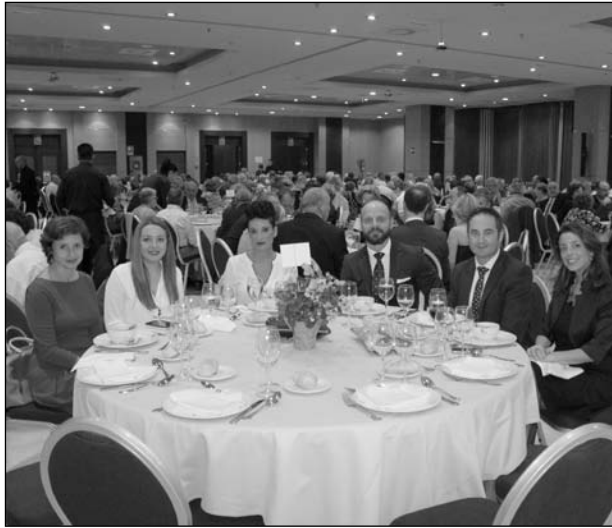
Mesa con autoridades y patrocinadores.