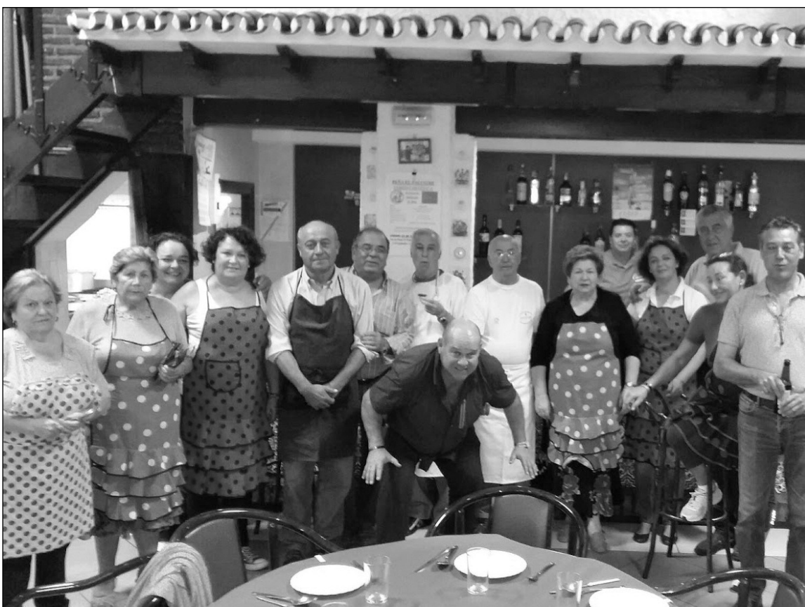
Grupo de socios voluntarios.