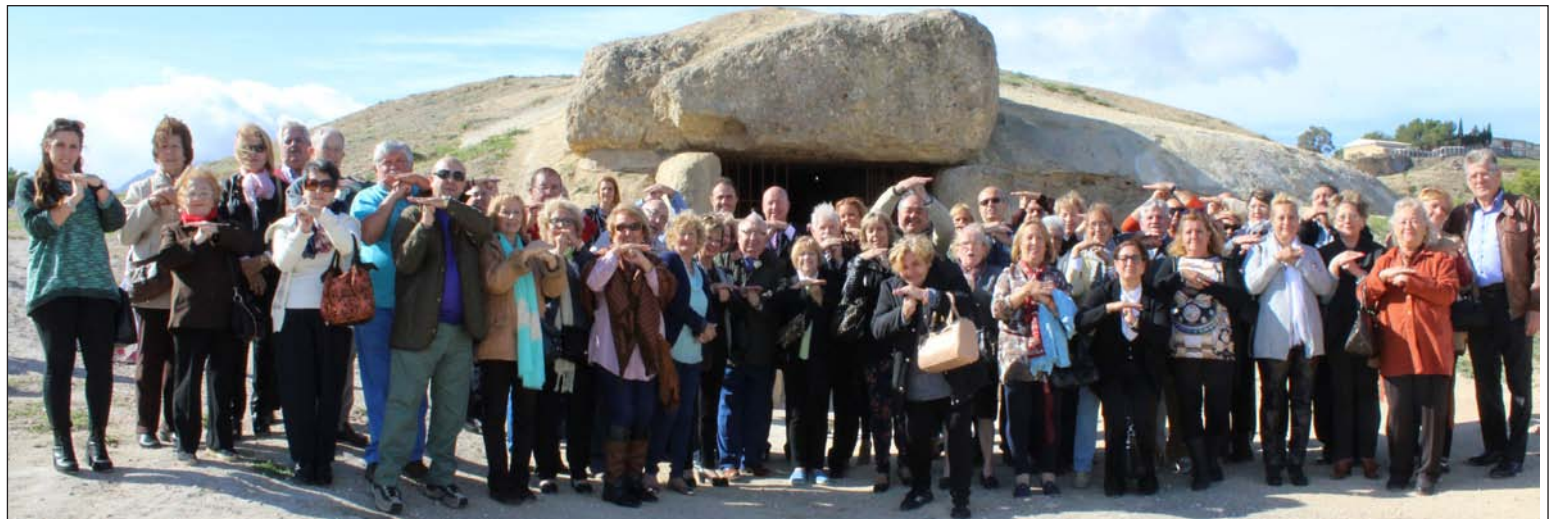
Participantes de esta excursión ante el dolmen de Menga.

Tras la comida, y antes de retornar a nuestra capital, un guía acompañaba a los participantes para conocer diferentes lugares de interés en la localidad, además de ofrecer la posibilidad de adquirir los típicos mantecados navideños. El autobús aguardaba pasadas las 18 horas en la plaza del Coso Viejo para regresar con la sensación de haber conocido una ciudad de belleza infinita.