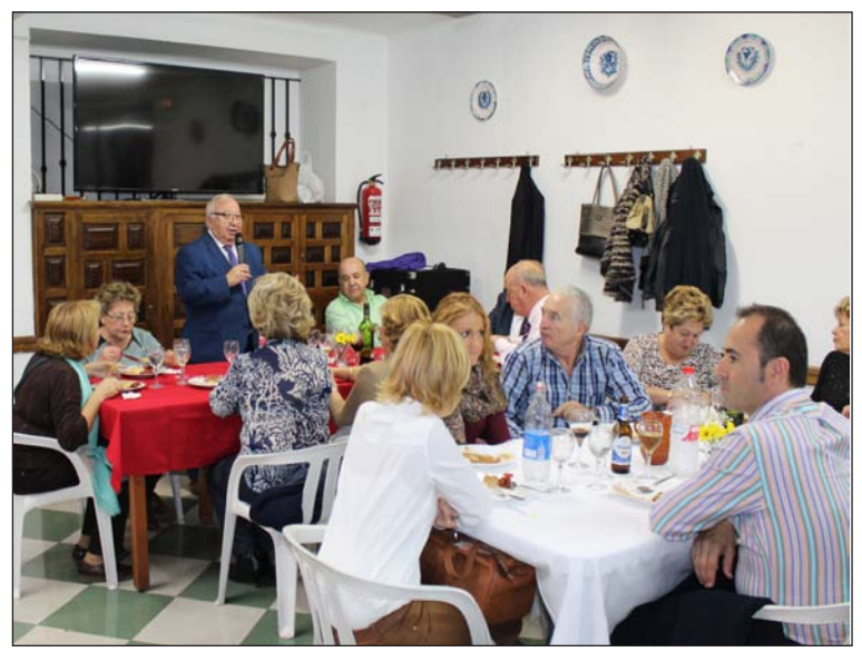
Intervención del presidente en la comida en la Sociedad Excursionista.