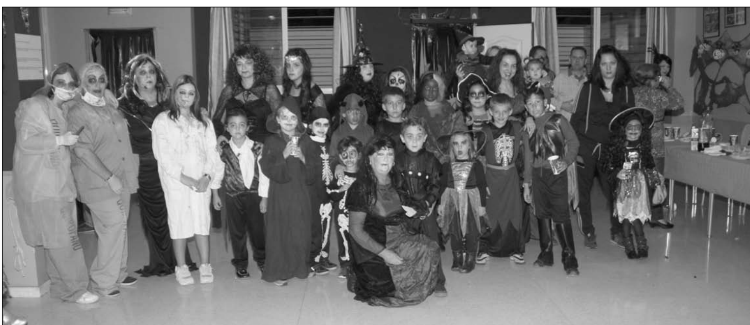
El pasado día 31 de octubre se celebró una Fiesta de Halloween a partir de las 18:30 en los salones de la Peña Santa Cristina. Niños y mayores de esta entidad federada disfrutaron de una actividad que cada año gana en adeptos.