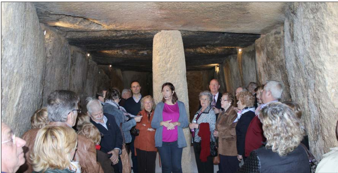
Visita al interior del Dolmen de Menga.