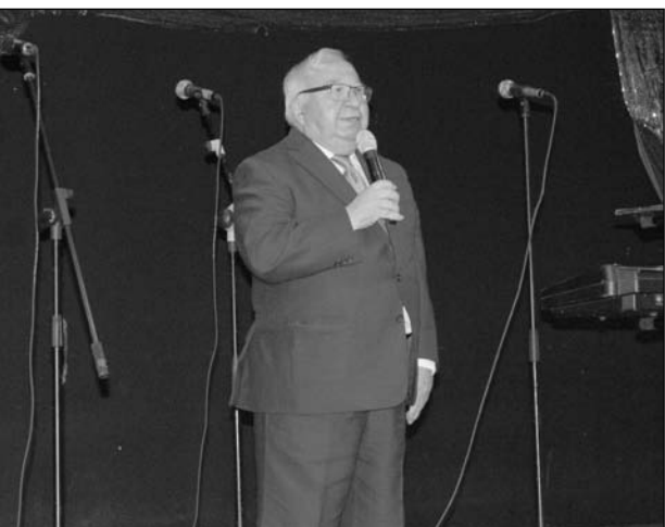
Intervención del presidente de la Federación de Peñas.