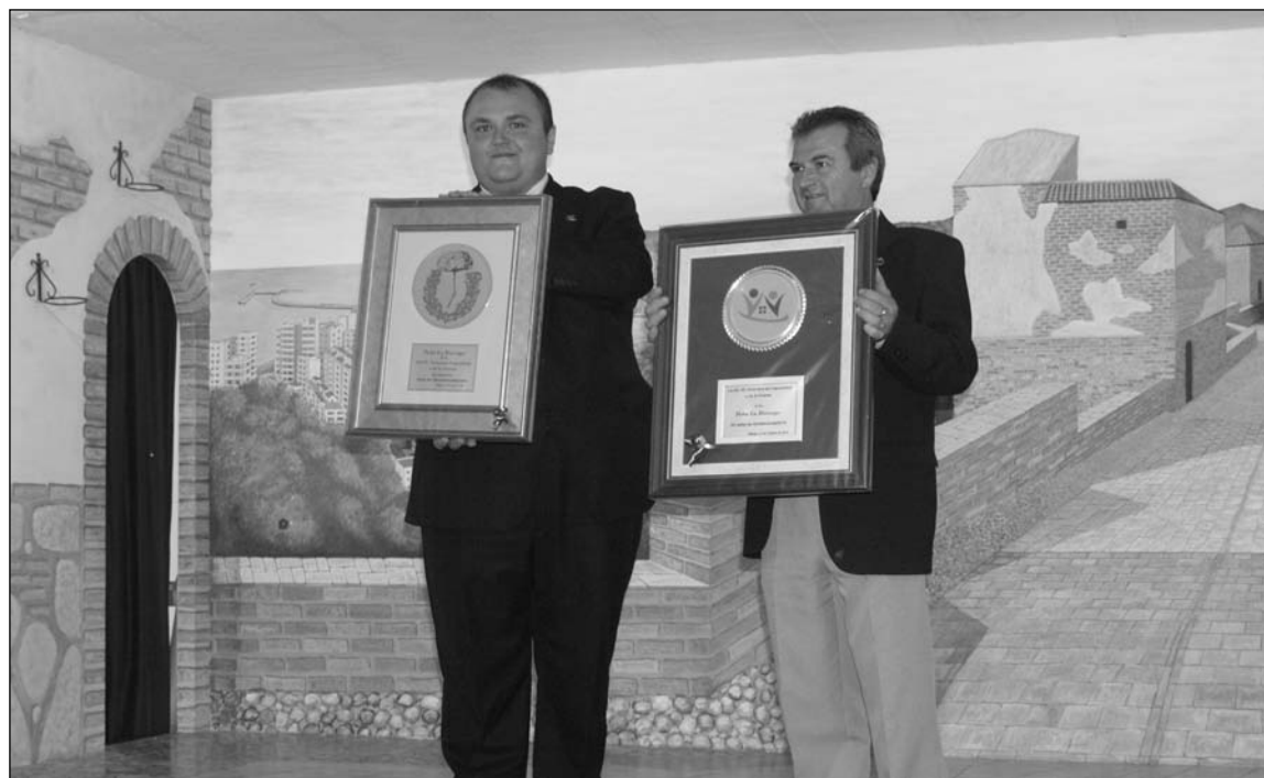
Intercambio de escudos de las dos entidades.

Para finalizar las actividades de este mes, el viernes 31 se realizaba la Fiesta de Halloween, para que niños y mayores lo pasasen en grande. A partir de las 22 horas, hubo premio al mejor disfraz, juegos, música, barra libre, así como caldito y bocadillo de jamón de madrugada.