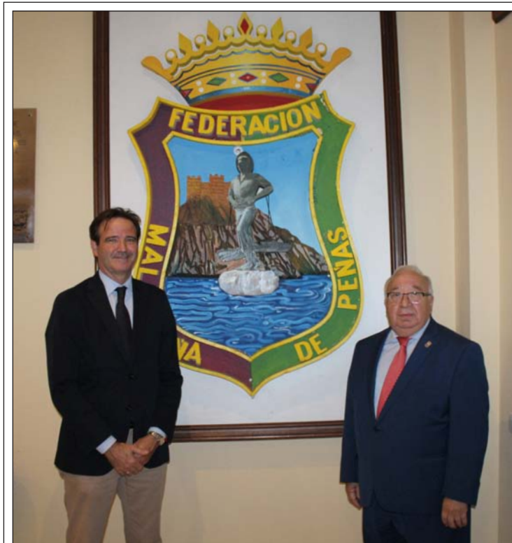
Visita del presidente de la Agrupación