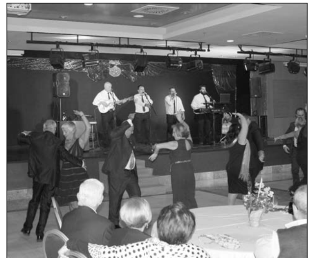
Baile por sevillanas.