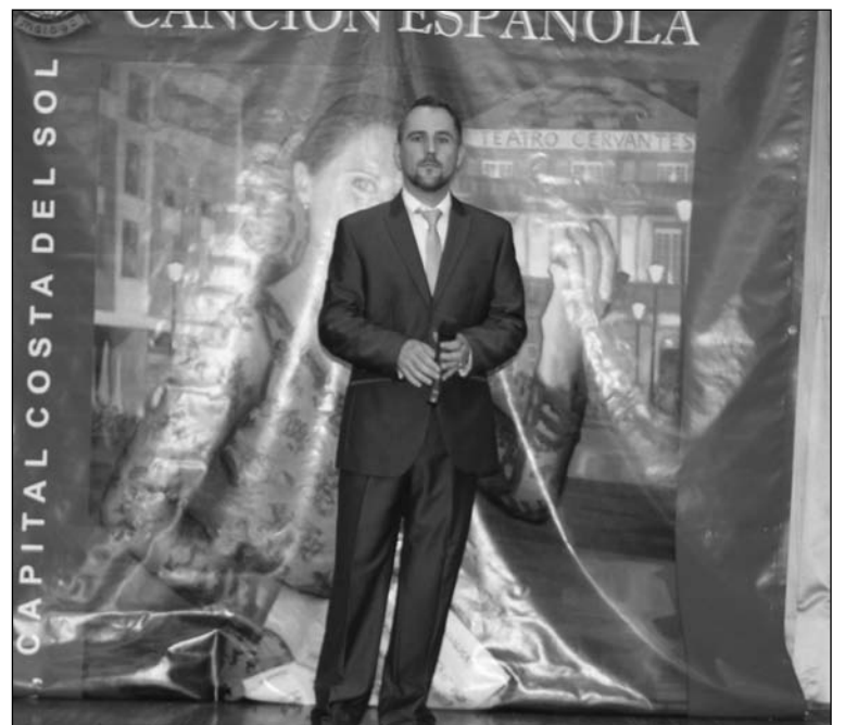
Aún quedan por celebrarse dos semifinales.