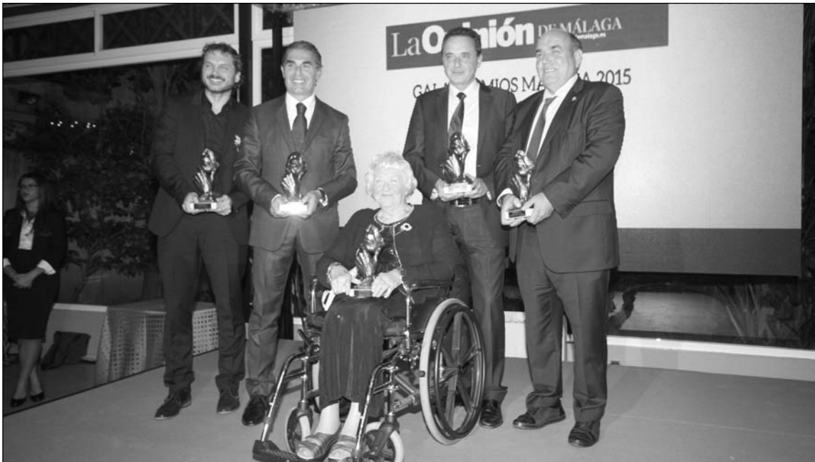
Premiados por el diario La Opinión de Málaga en este año 2015.