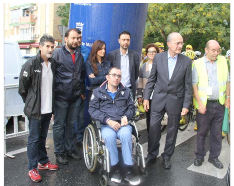
Autoridades y miembros de la organización.