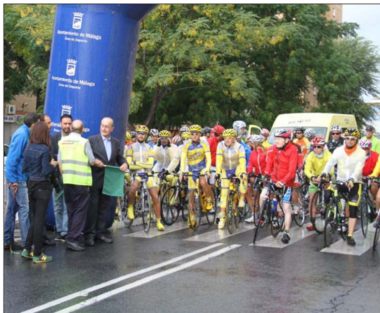
Momentos previos a la salida.