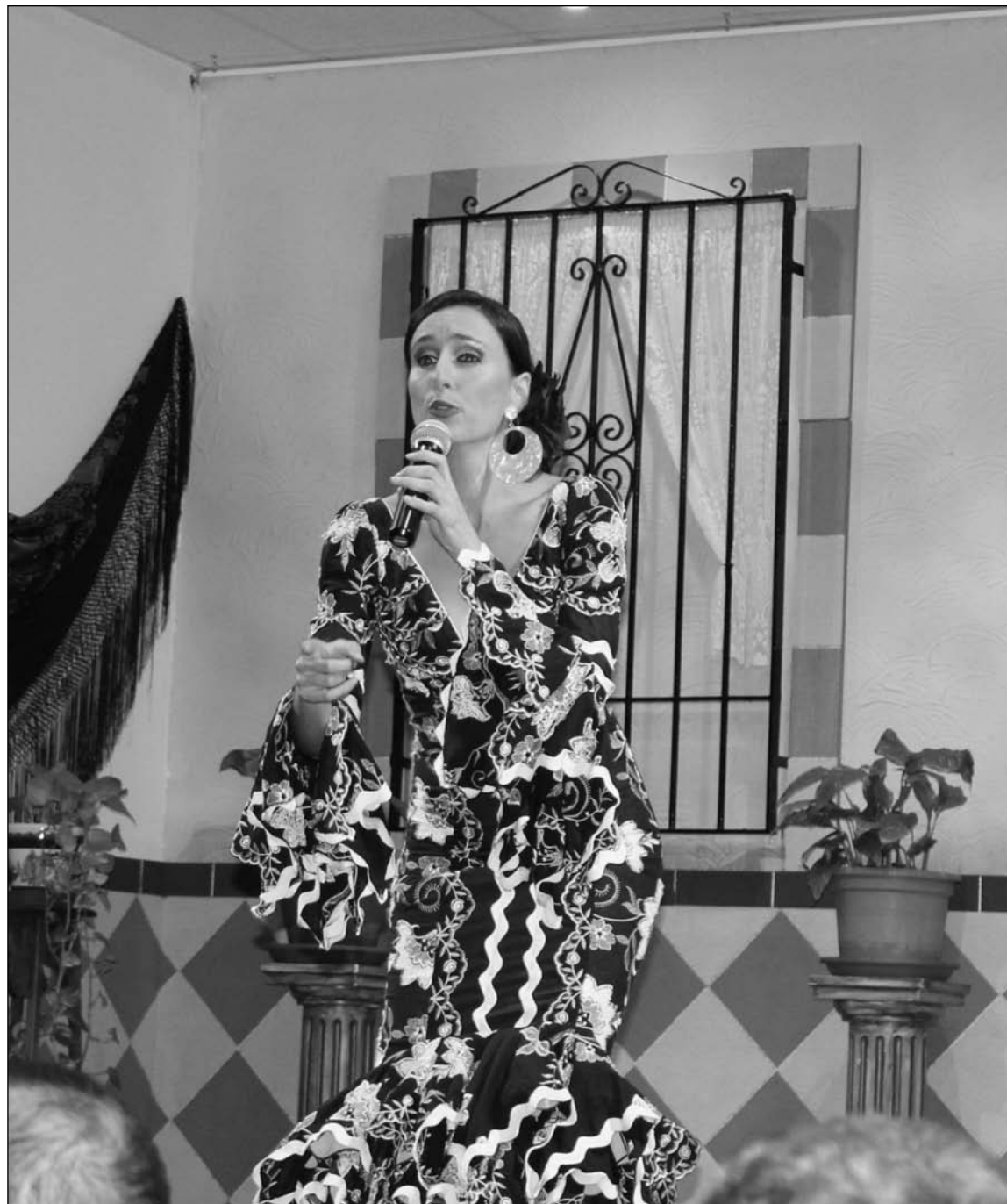
Imagen de una de las semifinales del Certamen de Copla.