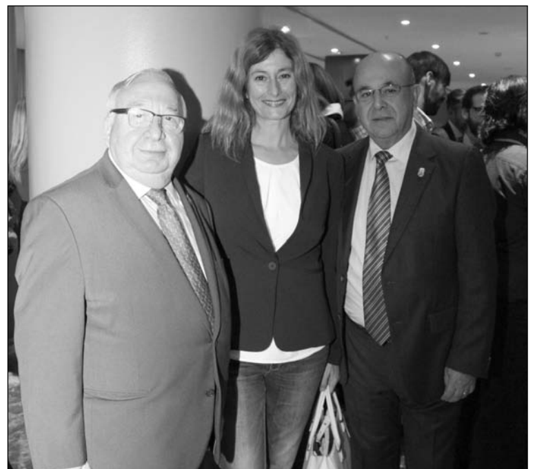
Representantes de la Federación con la diputada de Ciudadanos Irene Rivera