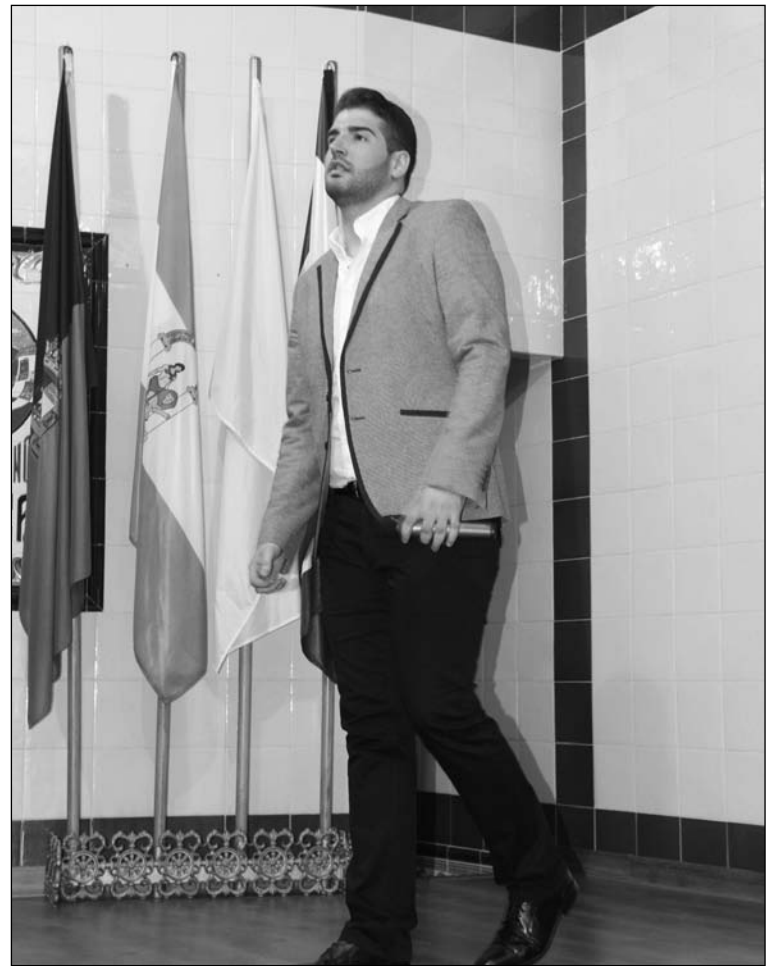
Uno de los participantes del certamen.