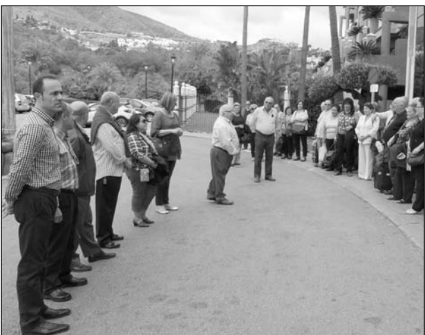
Miembros de la directiva despiden a los mayores.