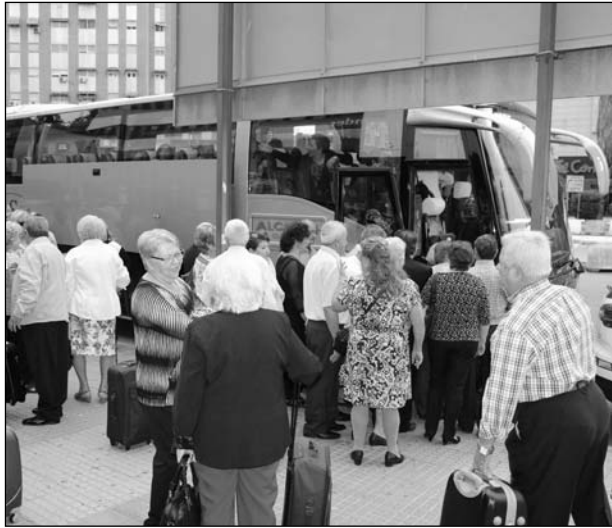
Los inscritos se saludan antes de subir al autobús.