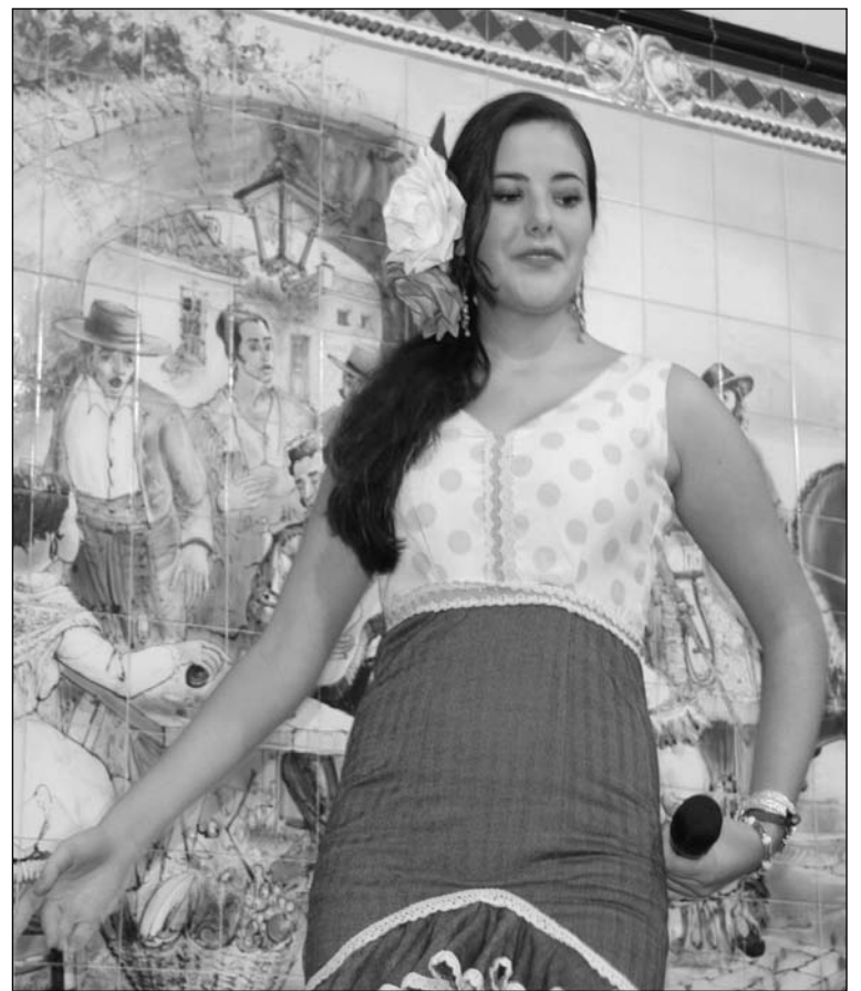
Una de las concursantes, en el escenario de la entidad.

Una de estas grandes novedades es que el ganador de este certamen tendrá una gala en la feria del distrito del próximo año 2016.