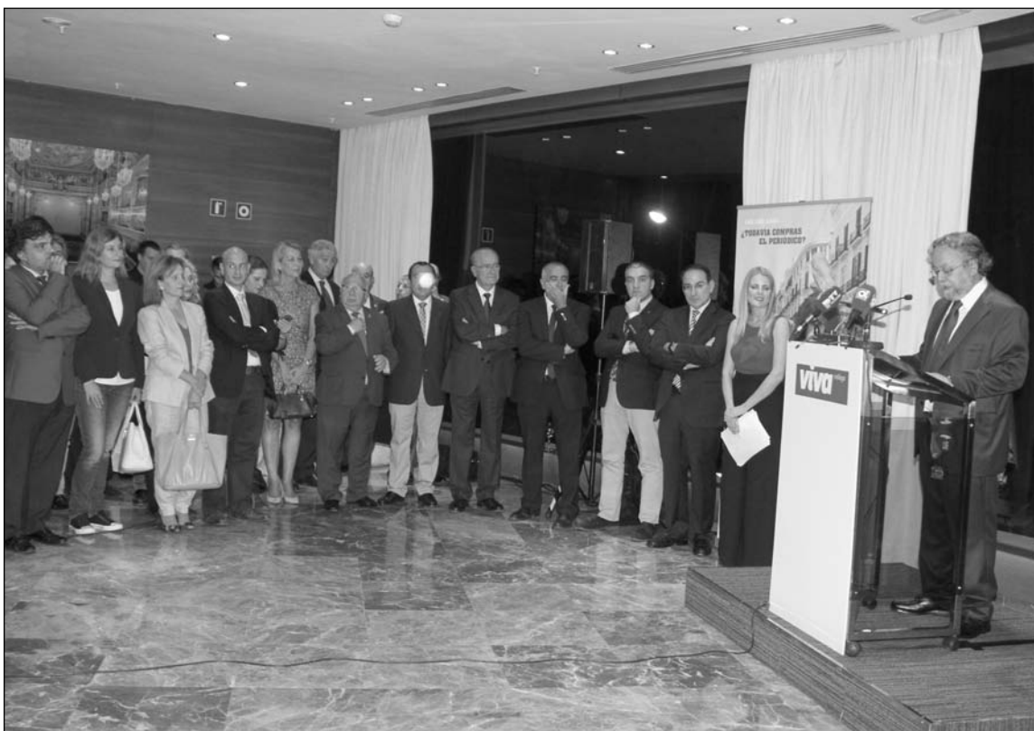
Acto de presentación del periódico.