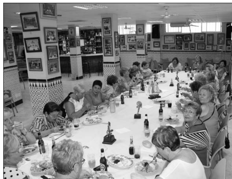
Vista general del salón.