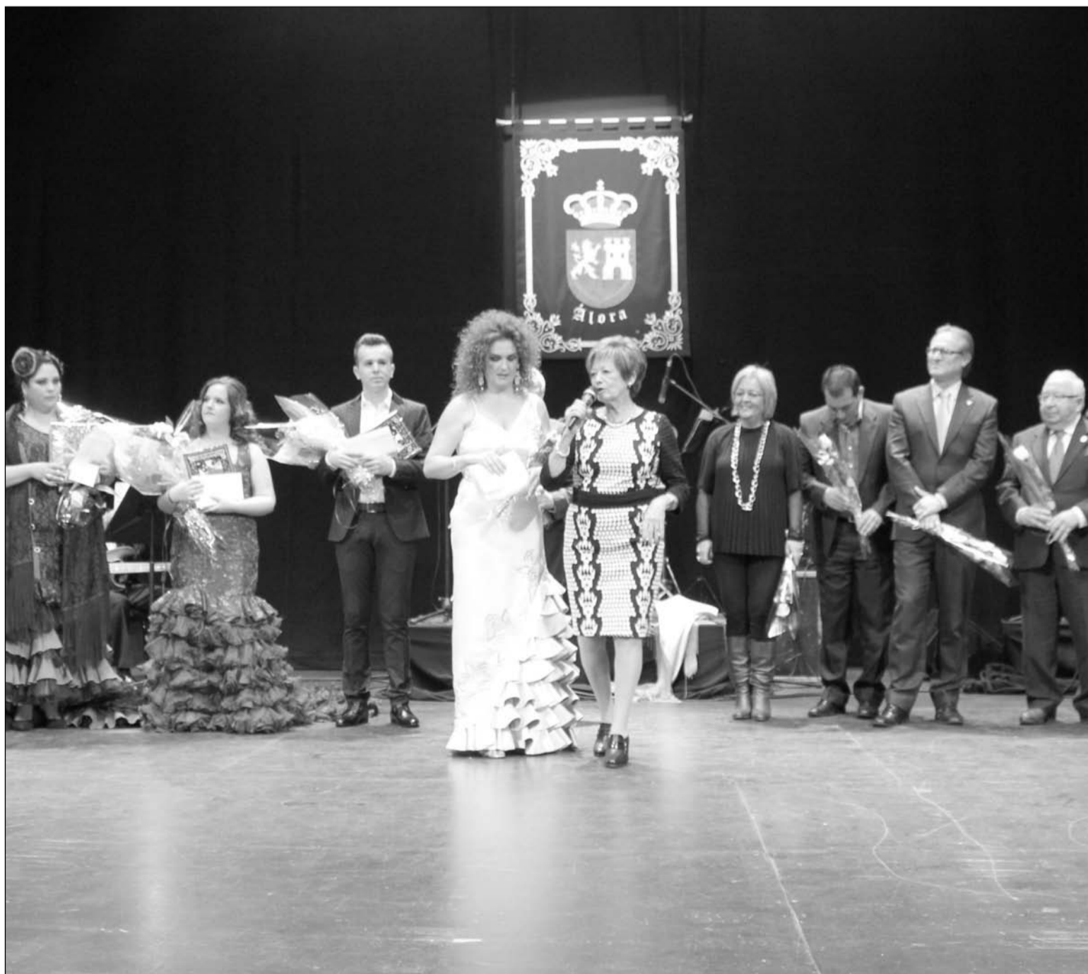
Final del Certamen del pasado año, en el Teatro Cervantes.