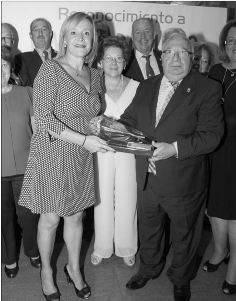
Entrega de un recuerdo por parte de la Federación de Peñas.