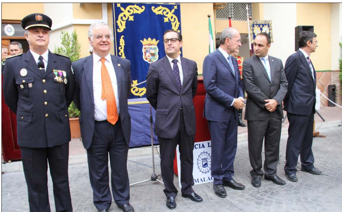
Autoridades presidiendo el acto.

Entre los invitados se encontraba la Federación de Peñas.