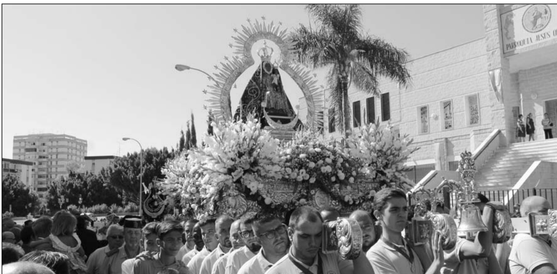
La Virgen en su trono, ante su iglesia.