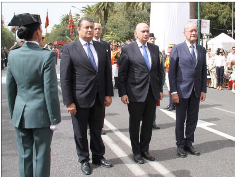
El delegado del Gobierno, el ministro de Interior y el alcalde de Málaga.