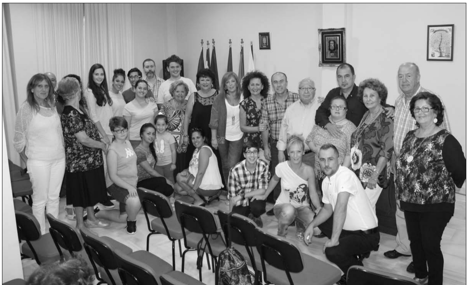
Algunos de los alumnos con directivos de la Federación.

Las particulares características de la Escuela de Copla 'Miguel de los Reyes', marcadas fundamentalmente por su personalización, calidad y gratitud, la han convertido en referente de la formación musical en nuestra capital.