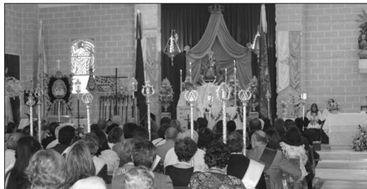
Función principal celebrada antes de la procesión.

La imagen fue portada a hombros por los anderos, nombre con el que se conoce a los hombres de trono de la Virgen de la Cabeza.