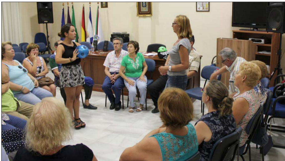
Imagen del taller lúdico impartido con anterioridad en la sede de la Federación.

Este no será el único curso impulsado durante los próximos meses desde la Federación Malagueña de Peñas. De este modo, en los meses de noviembre y diciembre se impartirán nuevos temas de los que se informará a las entidades federadas en próximas comunicaciones.