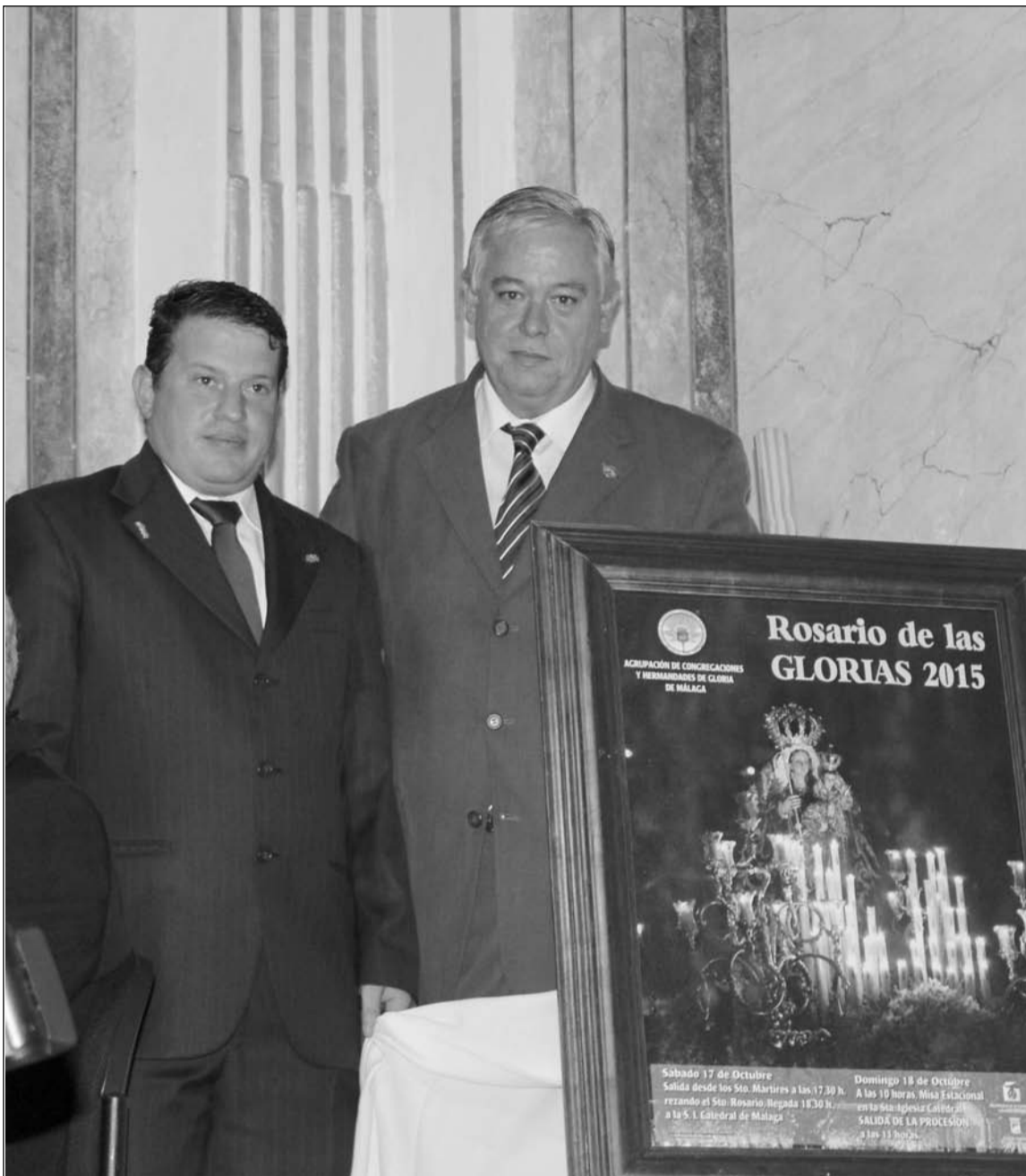
El cartel anunciador del rosario del próximo 18 de octubre.