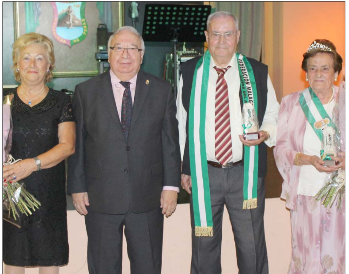
Reconocimiento a los Mayores del Año de 2014.

Esta actividad es exclusiva para mayores de 65 años, pudiendo cada entidad inscribir a través de su presidente a una pareja hasta completar las plazas limitadas con las que se cuenta.