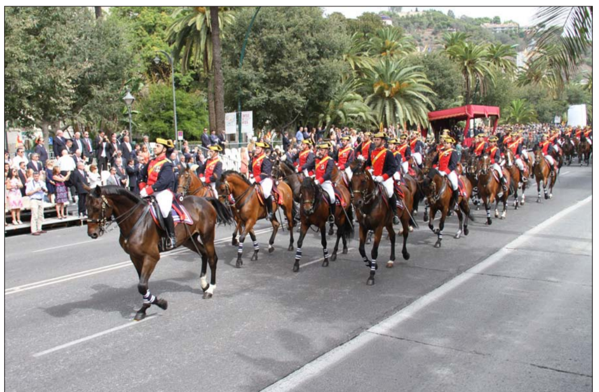
Caballería de la Guardia Civil en el Paseo del Parque.