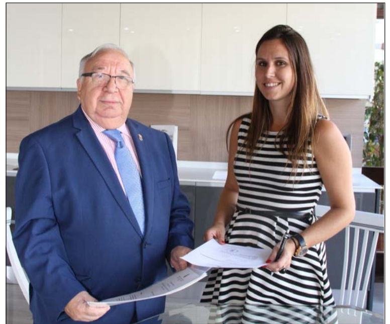
El presidente de la Federación y la gerente de Tesesa.

Desde Tesesa se apuesta por las tecnologías más vanguardistas para crear puertas y darles la mejor calidad, todo esto sin olvidar de cuidar con mimo y tradición cada detalle.