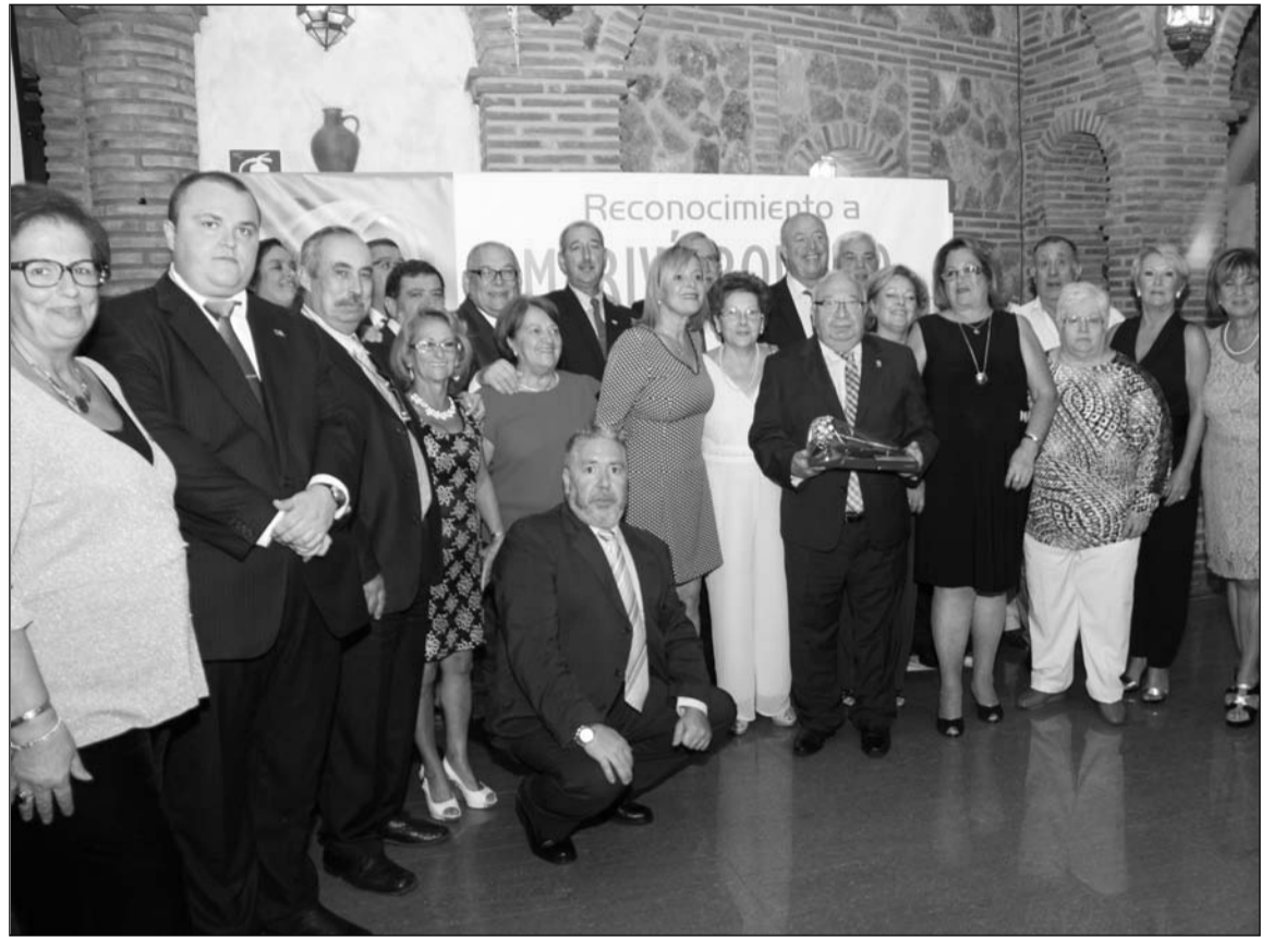
La homenajeadada, con algunos de los asistentes al acto.