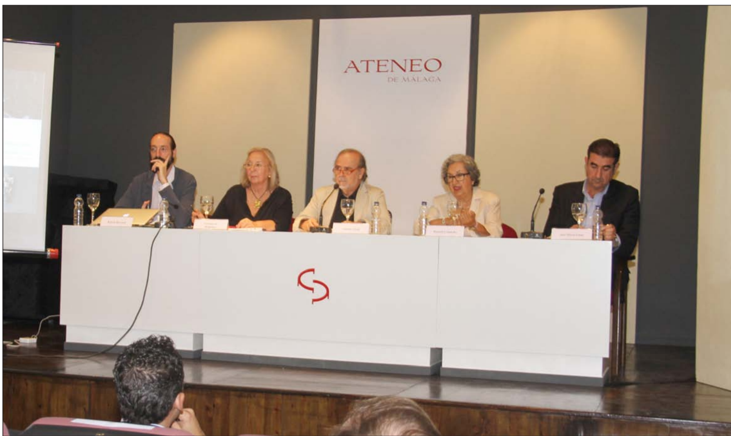
La Federación Malagueña de Peñas organizó el pasado 28 de septiembre una mesa redonda dedicada al escultor Berrocal en el Ateneo.

Número 584 7 de Octubre de 2015 C/ Pedro Molina, 1 Tfno: 952 22 54 39 Fax: 952 21 48 82 E-mail: prensa@femape.com - la_alcazaba@hotmail.com Web: www.femape.com Edición digital: www.femape.com/laalcazabadigital Twitter: @FMPLaAlcazaba Búsquenos también en Facebook