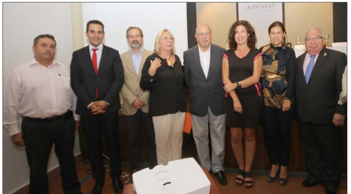
Autoridades asistentes al acto.

Pero la Ciudad de Málaga sigue teniendo una asignatura pendiente con este gran escultor malagueño, un espacio museístico donde una parte de su producción artística pueda ser divulgada y apreciada por todos los amantes del arte. Esperemos que este espacio pronto pueda ser una realidad.