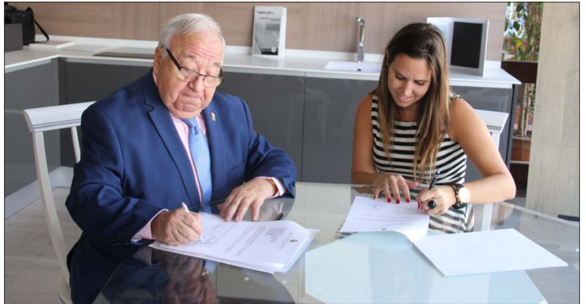
Firma de la renovación del convenio.

Tesesa Málaga se fundó en 1992; fecha en la que se independizó de Tecsesa, después de dos décadas como su filial en Málaga. A día de hoy pone a su servicio más de 30 años de experiencia en diseño y fabricación de puertas, armarios y sue-