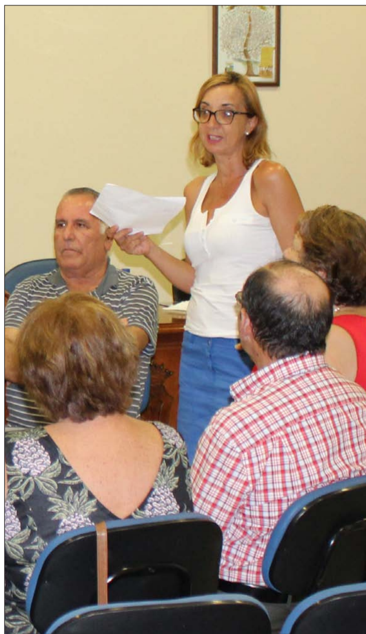
La Federación está impulsando distintos cursos para sus entidades.

Entidades colaboradoras con esta publicación: