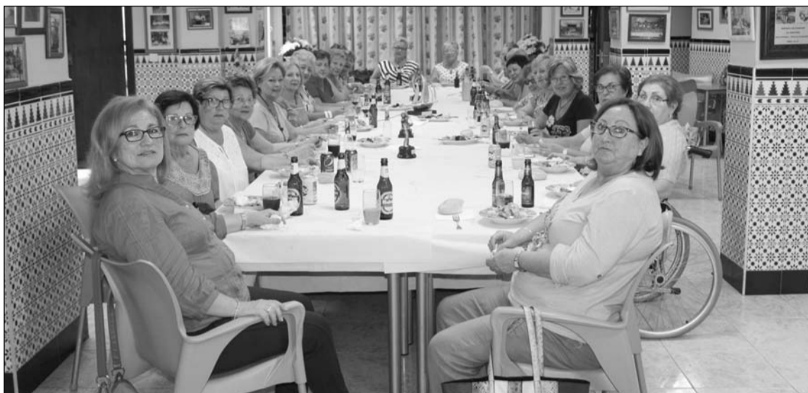
Participantes en la comida de hermandad para mujeres.