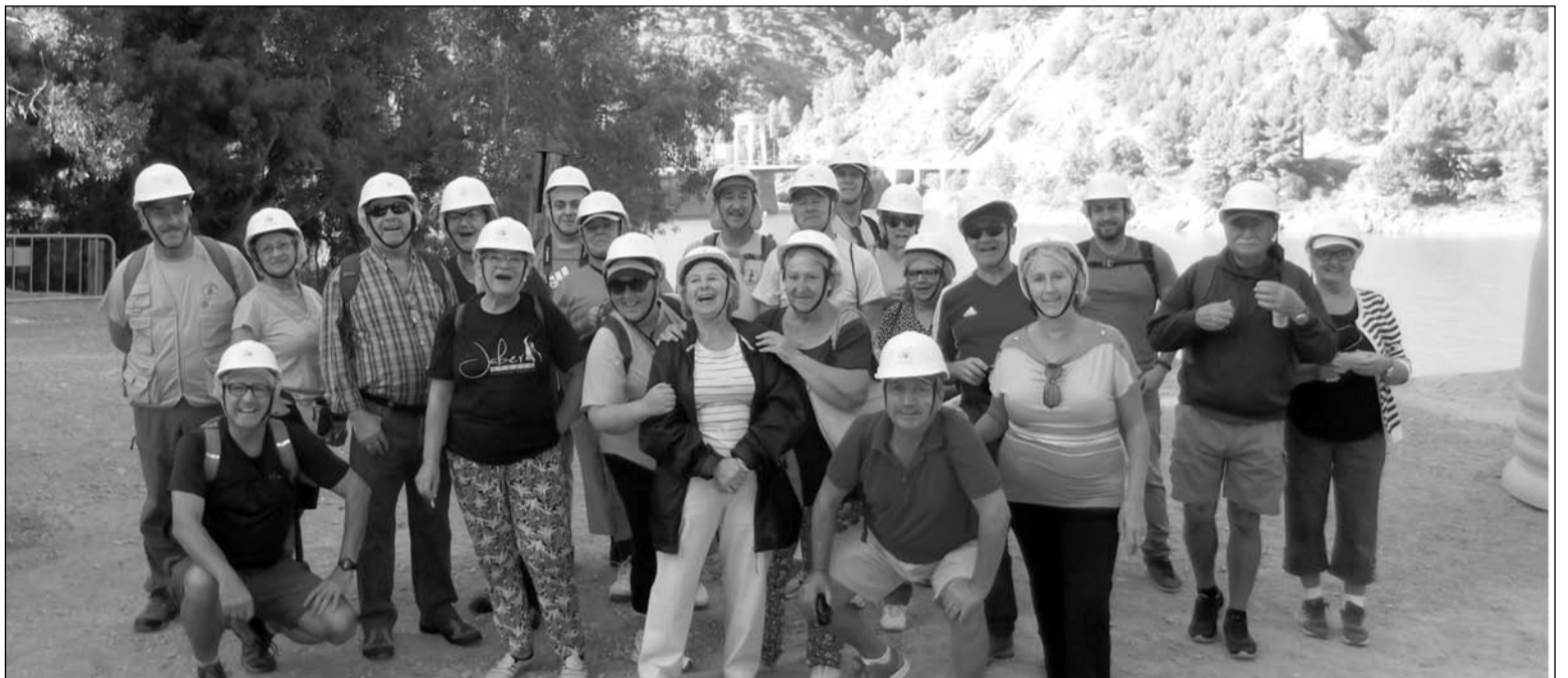
Socios de la Agrupación Cultural Telefónica en el Caminito del Rey.

Una de las partes más conocidas del "Caminito" es la pasarela en el Desfiladero de los Gaitanes. Este voladizo es perfectamente visible desde la vía férrea y todo aquel que lo contempla sale admirado de su arriesgada construcción y de los pintorescos paisajes que desde allí se vislumbran. Desde la carretera que une Álora con El Chorro, y a la entrada del Desfiladero, se puede ver un pequeño y pintoresco puente que une la pasarela que discurre por ambas paredes.