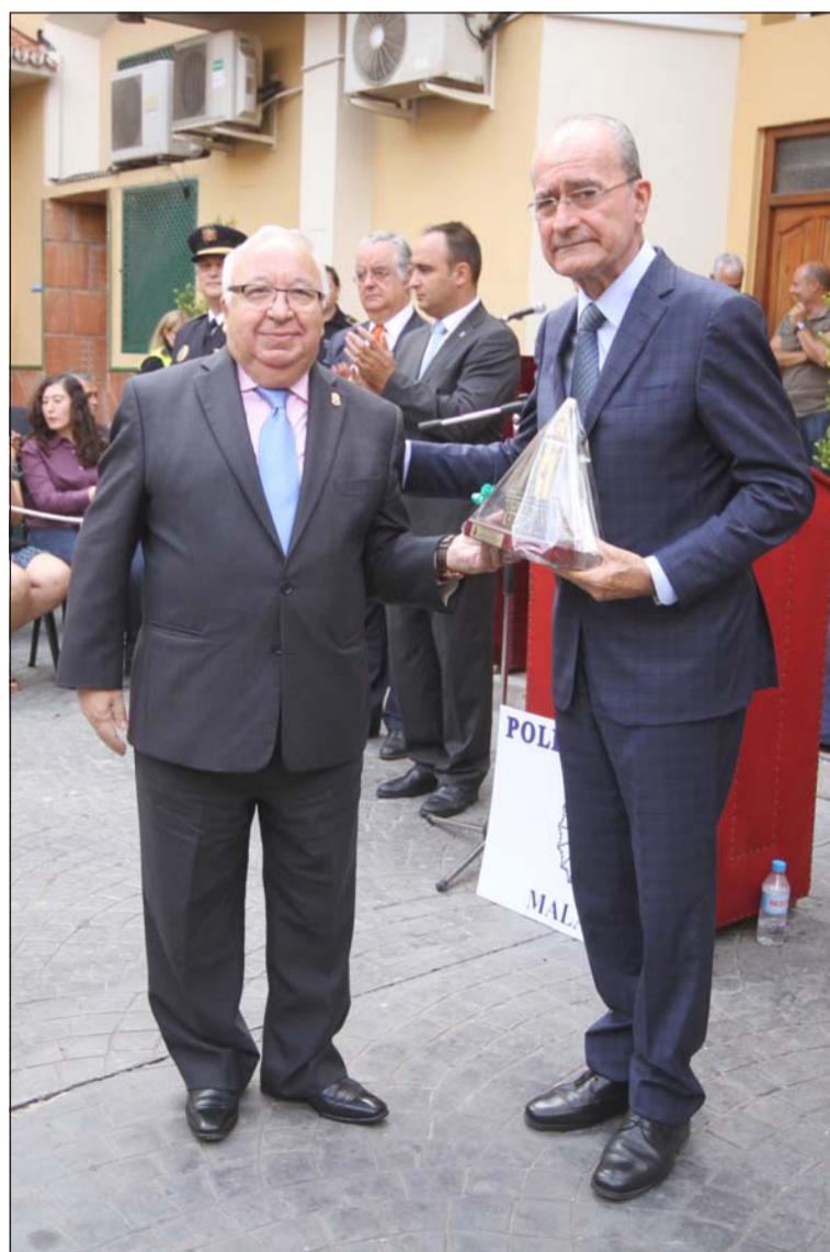
La Federación quiso entregar un recuerdo a la Policía Local, recogido por el alcalde.