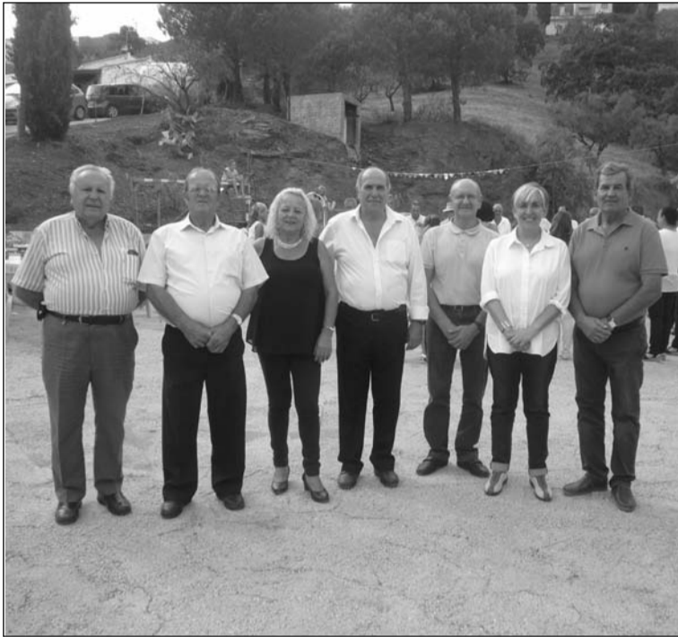
Portavoces de las maragatas.