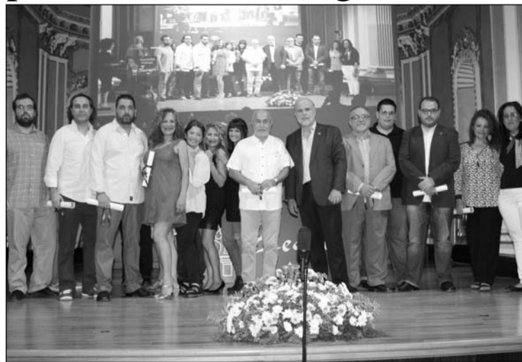
Entrega de distinciones por parte del presidente.