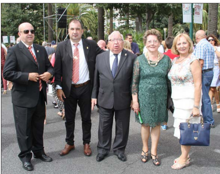
Representación de la Federación de Peñas tras la parada militar.