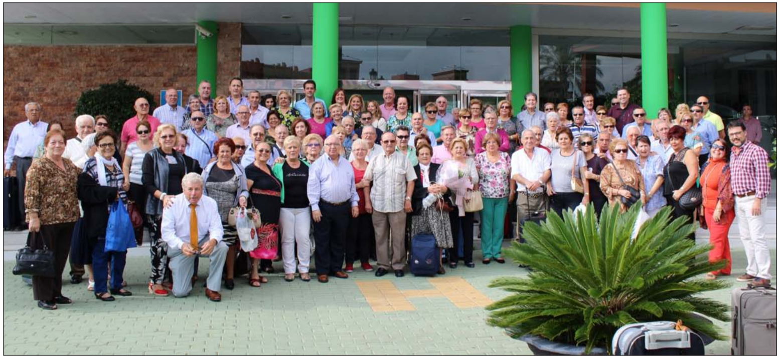
Algunos de los asistentes a la salida del hotel.

Hay cosas que son exclusivamente malagueñas