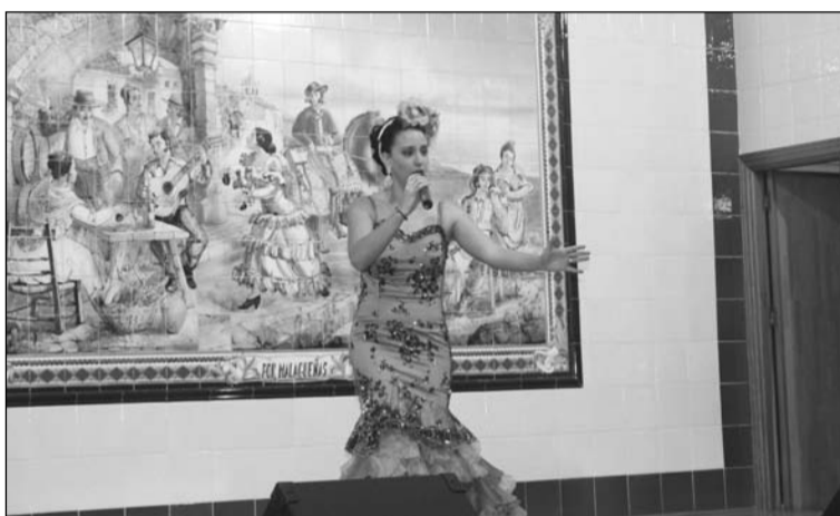
Imagen de archivo de una edición anterior.

Una de estas grandes novedades es que el ganador de este certamen tendrá una gala en la feria del distrito del próximo año 2016.