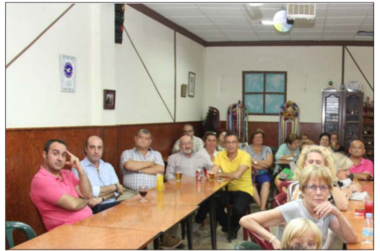
Socios atentos a la reunión.

La Peña Er Salero tiene sus orígenes en el año 1979, y desde entonces viene desarrollando una gran labor en la barriada de El Torcal.