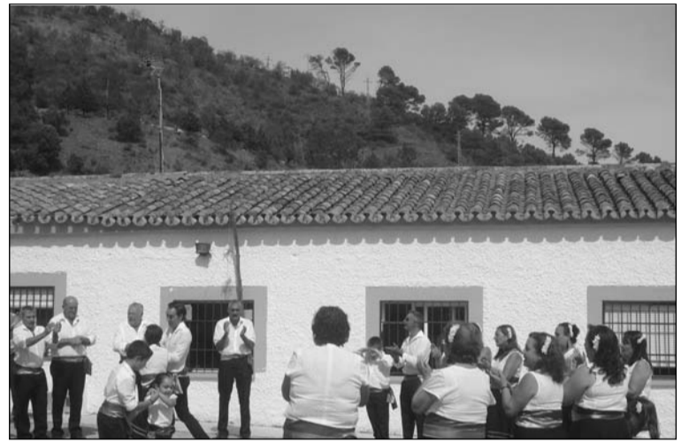
Maragatas de El Detalle

Gastronomía autóctona, cantos y bailes populares, junto con toda una serie de juegos para grandes y pequeños, deleitaron a quienes acudieron con el fin de pasar un magnífico día en el núcleo rural de El Detalle, justo al lado del Parque Natural de los Montes de Málaga.