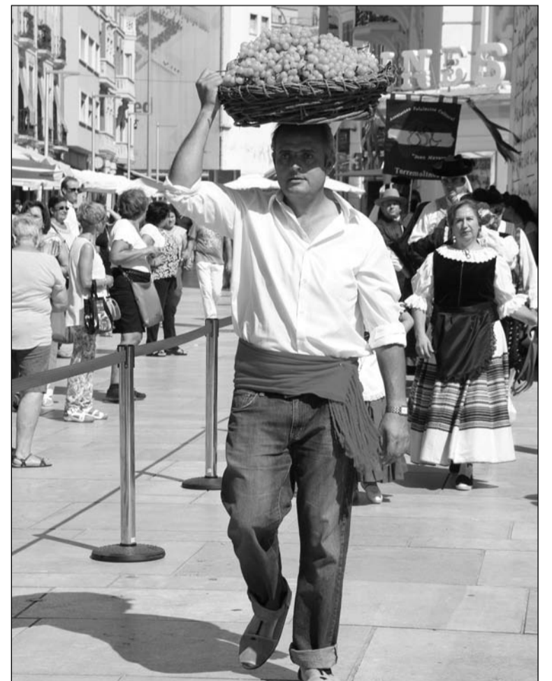
Instantes previos a la pisa, con los grupos folclóricos de fondo.

Este acto cultural se enriqueció con una selección de 22 magníficos trajes tradicionales malagueños de las localidades de: Coín, Alcaucín, Vélez-Málaga, Corte de la Frontera, etc, pertenecientes a la colección de la Asociación Folclórica-Cultural 'Juan Navarro'.