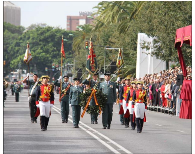
Inicio de la parada militar.

Esa misma tarde se realizaba una Ofrenda a la Virgen de la Victoria, Patrona de Málaga, en la