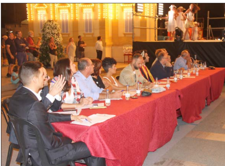
El jurado, atento a los concursantes.