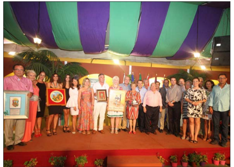
Autoridades y premiados en la noche del martes de feria.