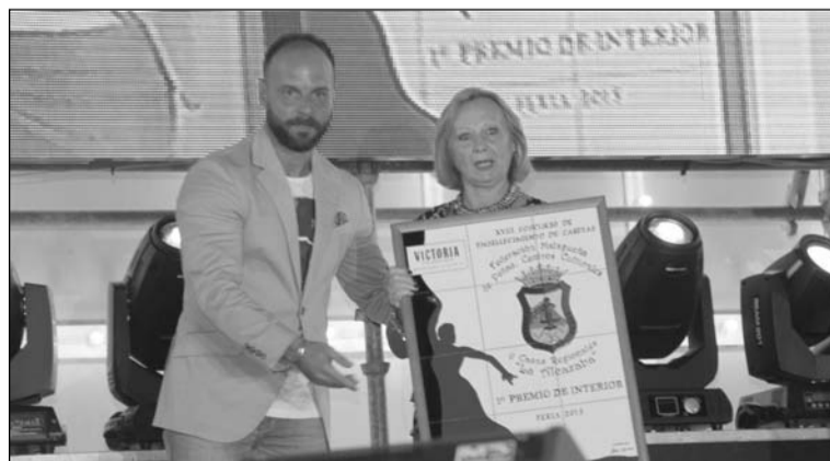
Entrega del premio de interiores.