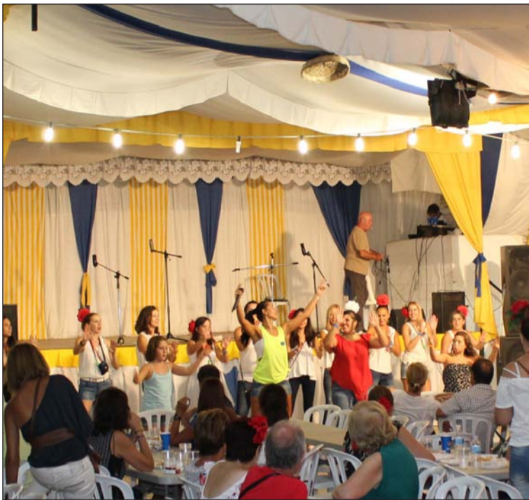
Ambiente en el interior de la caseta de esta entidad.