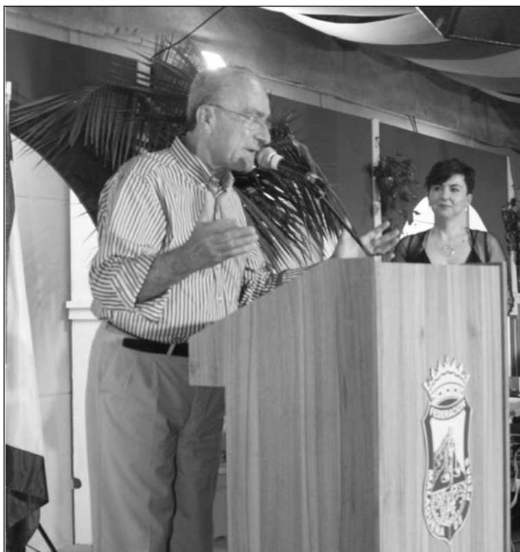
Intervención del alcalde, Francisco de la Torre.