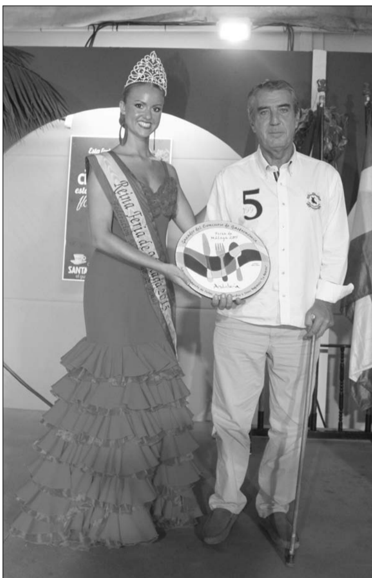
La Reina Mar Montilla y Francisco Javier López, presidente del Portón.

La gastronomía es un pilar fundamental de la oferta que cada año ofrece la Feria de Málaga a todos los turistas que visitan la Costa del Sol, ofreciendo la mejor cocina tradicional en un entorno en el que prima la música popular y el ambiente festivo, donde las degustaciones se entremezclan con las actuaciones de coros y grupos de baile.