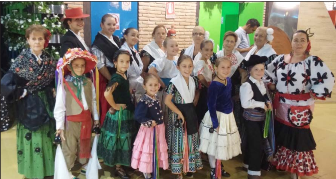
Grupo de la Asociación-Escuela de Folklore 'M' del Mar Sillero' que actuó el sábado 15 en la caseta de PTV Telecom.