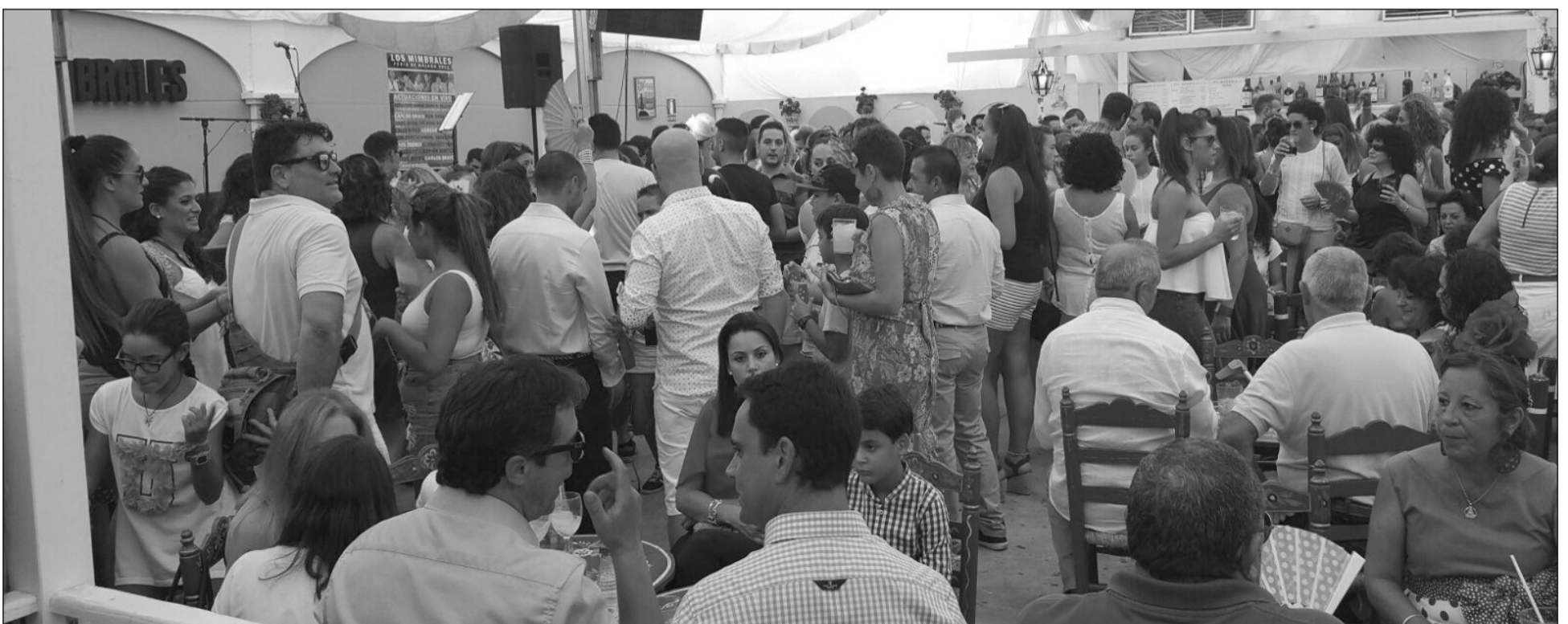
Ambiente que se ha vivido en esta caseta durante la feria.

Además, los socios de esta entidad perteneciente a la Federación Malagueña de Peñas, Centros Culturales y Casas Regionales 'La Alcazaba' estuvieron invitados a una copa de bienvenida e inauguración de la nueva caseta en la jornada de sábado 15 de agosto, desde las 15 horas. Además, la Cena de Socios se realizaba el martes 18 por la noche.