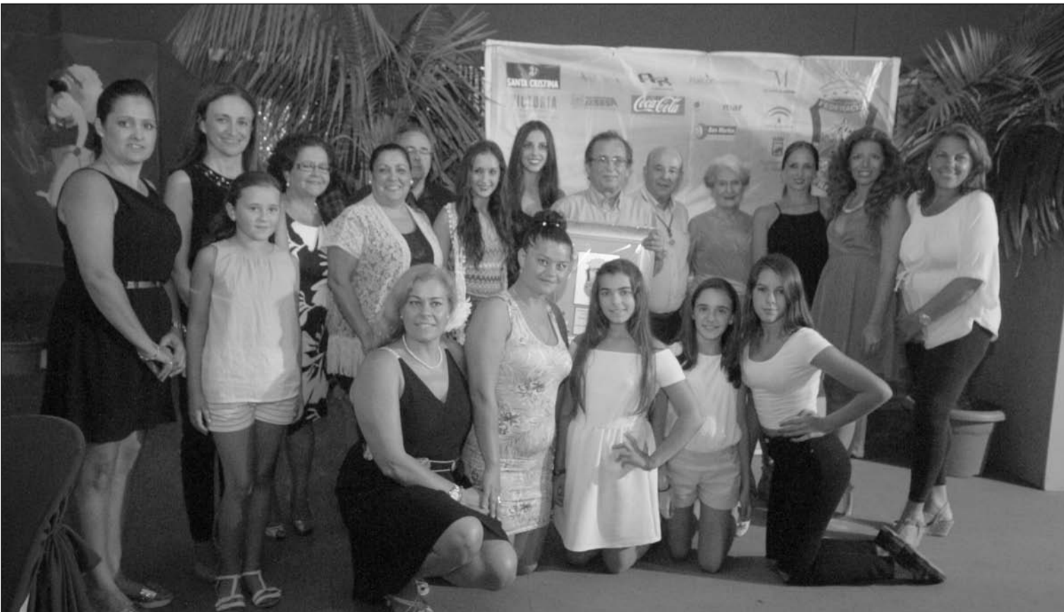
Componentes de Solera en la caseta de la Federación Malagueña de Peñas.

Solera celebró su XXV Aniversario el día 28 de febrero con un gran acontecimiento en el nuevo Edificio Inteligente Promocional de Alhaurín de la Torre, organizando un evento cultural acorde al gran apoyo y estima recibidos en este cuarto de siglo por sus vecinos; dando cabida a las artes que están relacionadas con los fines culturales de la asociación, entre ellos, el canto, baile y la música popular. Todo ello a modo de maratón, desde las 11 de la mañana hasta las 11 de la noche, de forma ininterrumpida, con la colaboración desinteresada de personas, cantantes y músicos solistas, academias y escuelas de baile, coros locales y de la capital, que están hermanados o son colaboradores y simpatizantes del colectivo Solera.