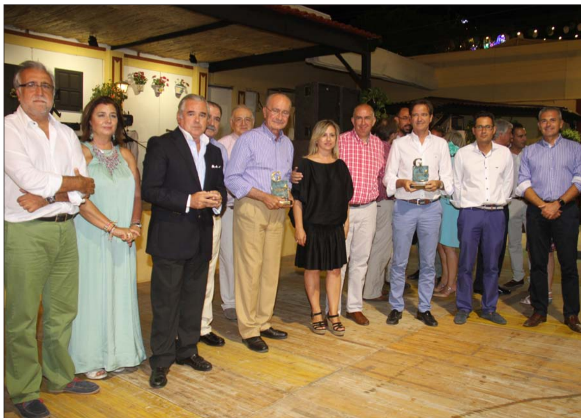
Entrega de los Premios Galeno del Colegio de Médicos en la caseta de El Portón.