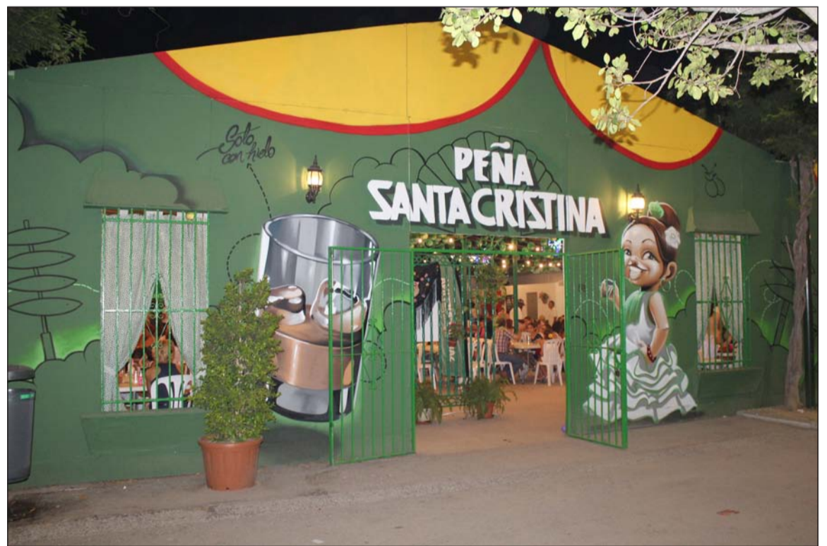
Fachada de la caseta de la Peña Santa Cristina.