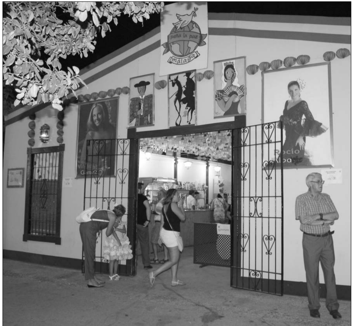
Fachada de la caseta de la Peña La Paz.

Estos premios se concedieron gracias al patrocinio de diferentes empresas colaboradoras con este colectivo. De este modo, las relativas a interiores fueron entregados por Cervezas Victoria, Tesesa y Diario Sur; mientras que las de fachadas correspondieron a Cafés Santa Cristina, Coca Cola y Vulcanizados San Martín, respectivamente.