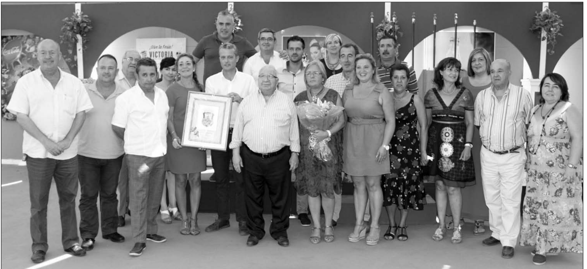
Comida ofrecida a los Servicios Operativos municipales en la caseta La Alcazaba.

Paralelamente al pregón que pronunciaba en la plaza de La Malagueta el cantante Pablo López, se celebraba una cena con la caseta ya dispuesta para su apertura unas horas después. Directivos, patrocinadores y trabajadores de la Federación brindaron por una gran Feria de Málaga 2015.