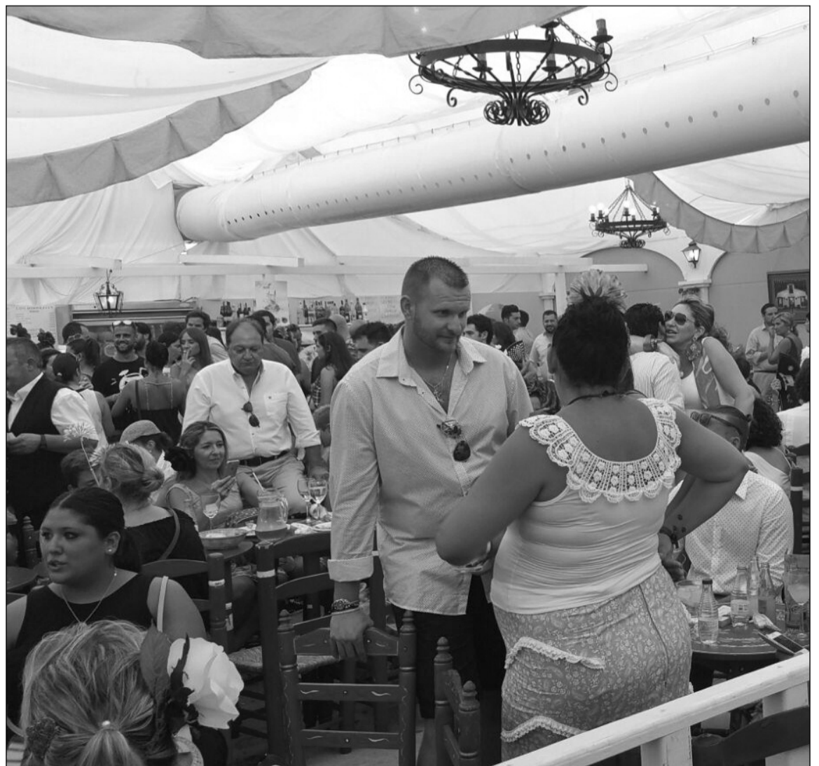
Interior de la caseta de Amigos de Los Mimbrales.