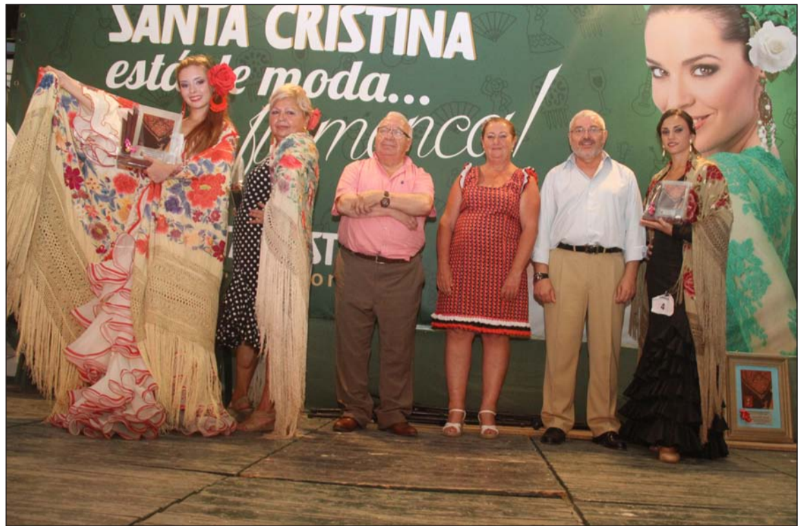
Mejores mantones bordados.