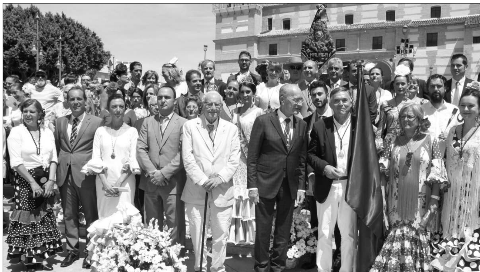
La comitiva, a su llegada al Santuario.