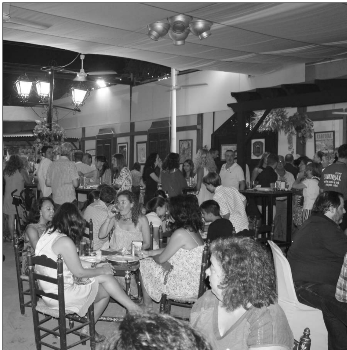
Interior de la caseta de El Portón durante la presente feria.