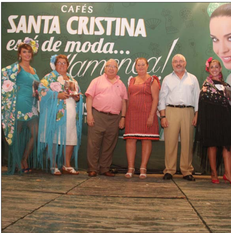
Mejores mantones pintados.