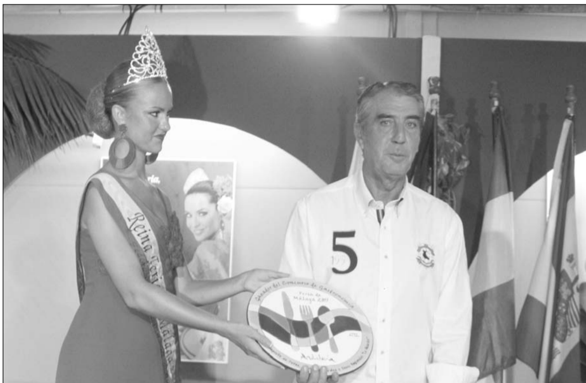
La Reina de la Feria fue la encargada de entregar el premio.

Este concurso cuenta con el patrocinio de la Empresa Pública para la Gestión del Turismo y del Deporte de la Junta de Andalucía