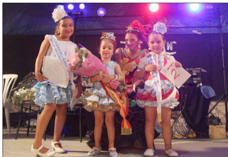
Elección de Reina Infantil y Juvenil en la Peña Ciudad Puerta Blanca.