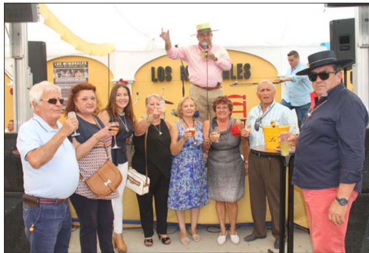
Copa de Socios de la Peña Los Amigos de Los Mimbrales.