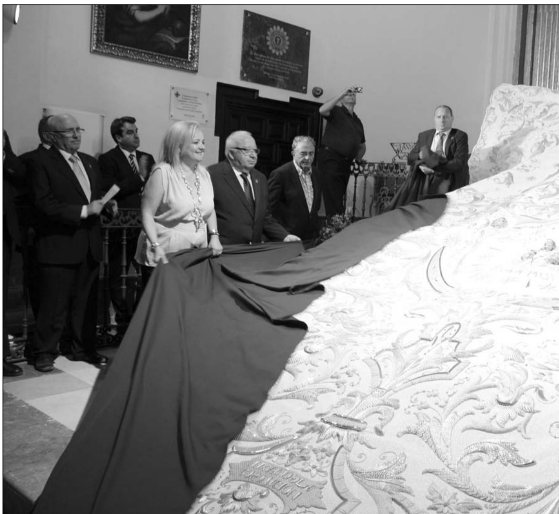
Instante en el que se descubre el nuevo manto.