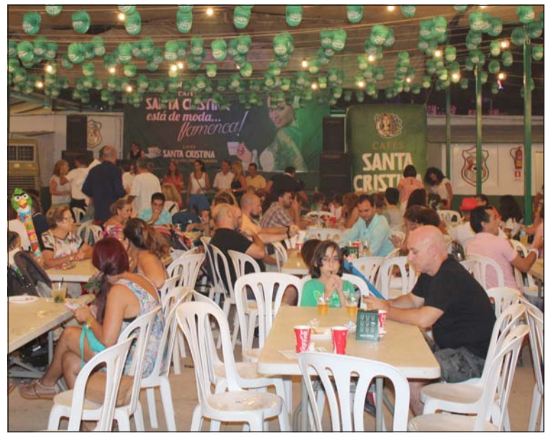
Ambiente familiar en el interior de la caseta.

Del 15 al 22 de agosto, esta caseta ha sido punto de encuentro de todos los malagueños, cumpliendo los objetivos que se marcaba.