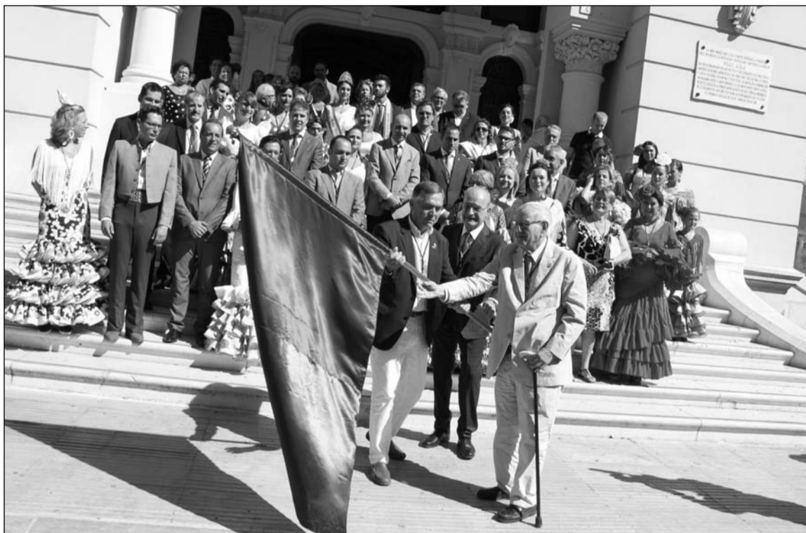
El alcalde entrega la bandera de la ciudad a los fundadores de El Pimpi ante la corporación municipal.