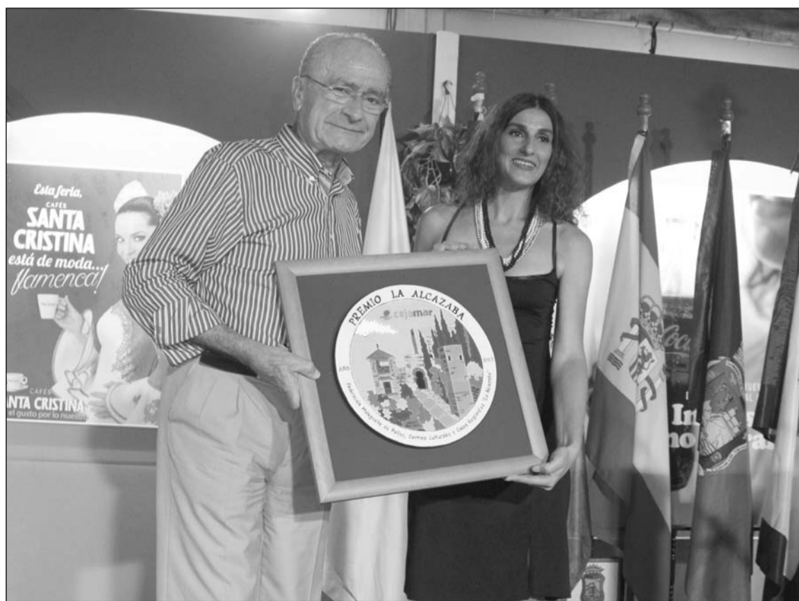
El alcalde entregó el premio La Alcazaba 2015.