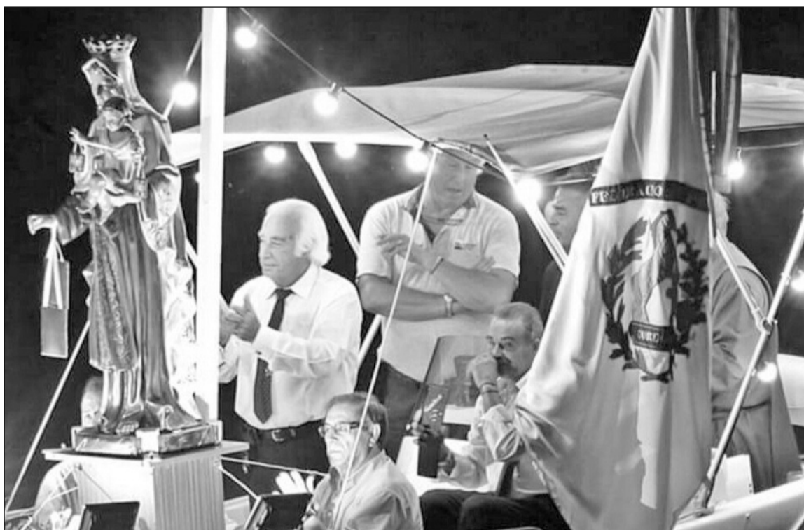
Virgen del Carmen donada por la Federación Malagueña, este año por el río Guadalquivir a su paso por Córdoba.