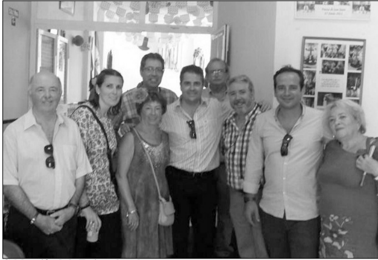
Celebración de la Feria en la sede.

Entre otros tapeos se ofreció degustación gratuita de un plato de berza el día 18 y arroz en paella el día 19.