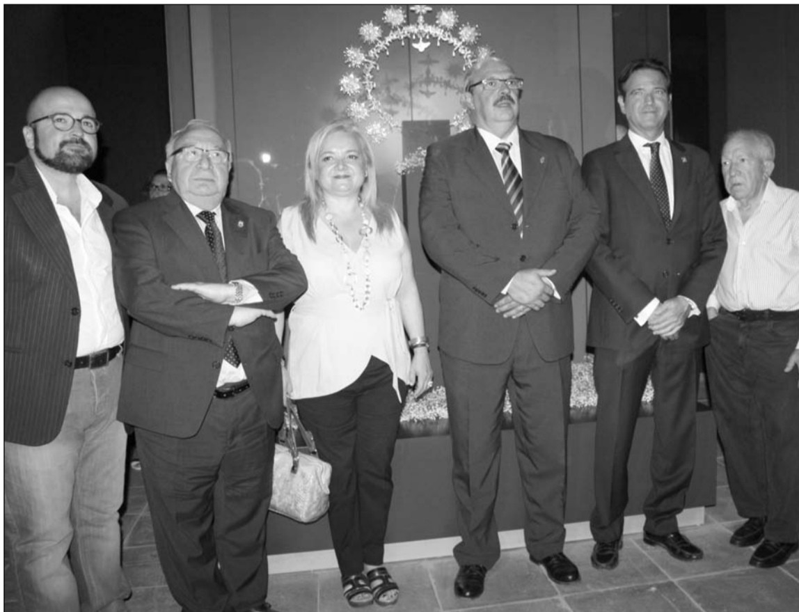
Imagen de grupo ante el halo con el que será coronada la Virgen del Rocío.