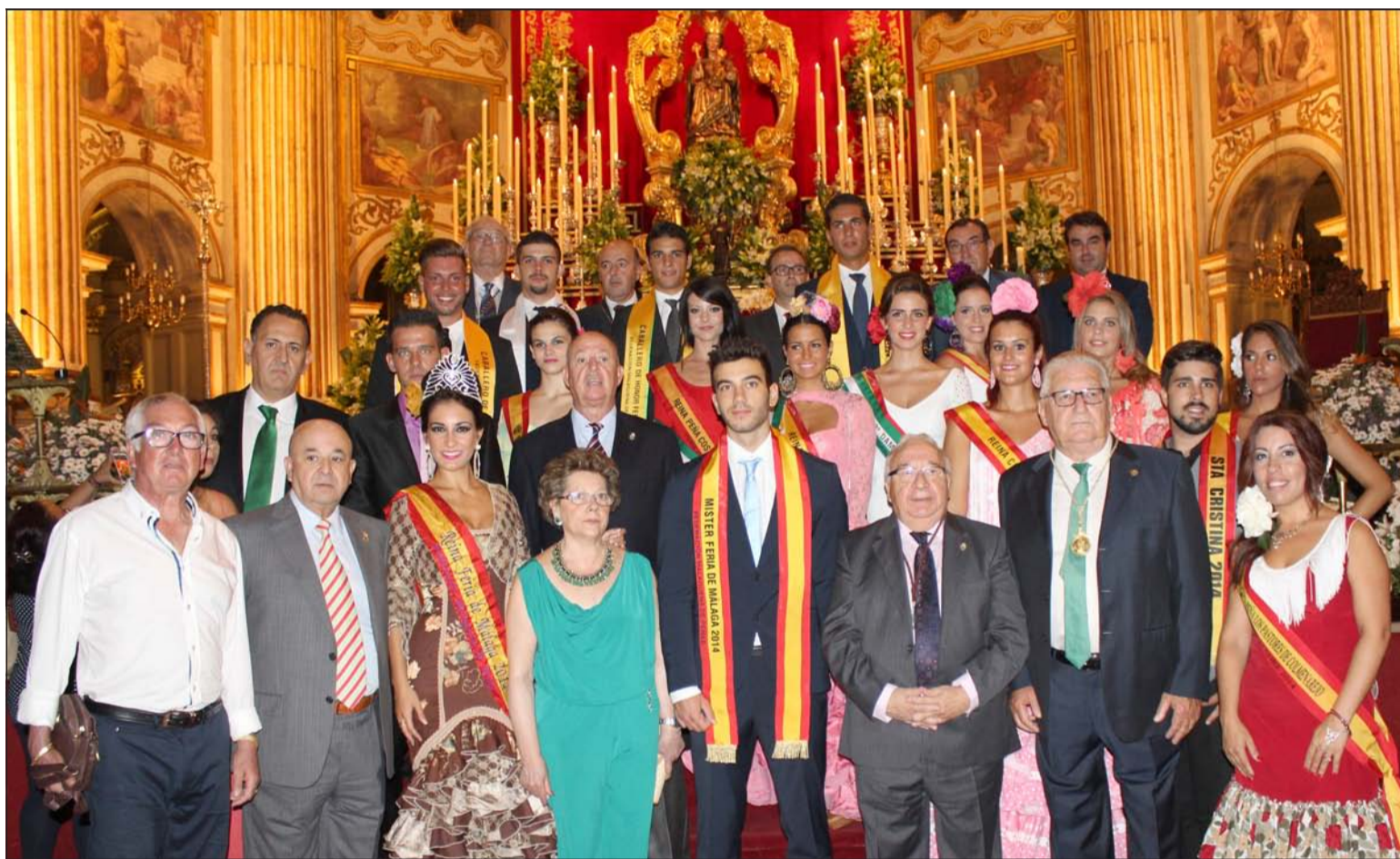
Ofrenda floral del pasado año a Santa María de la Victoria en la Santa Iglesia Catedral.

los que participen en este cortejo acompañando a componentes de la junta directiva de la Federación.