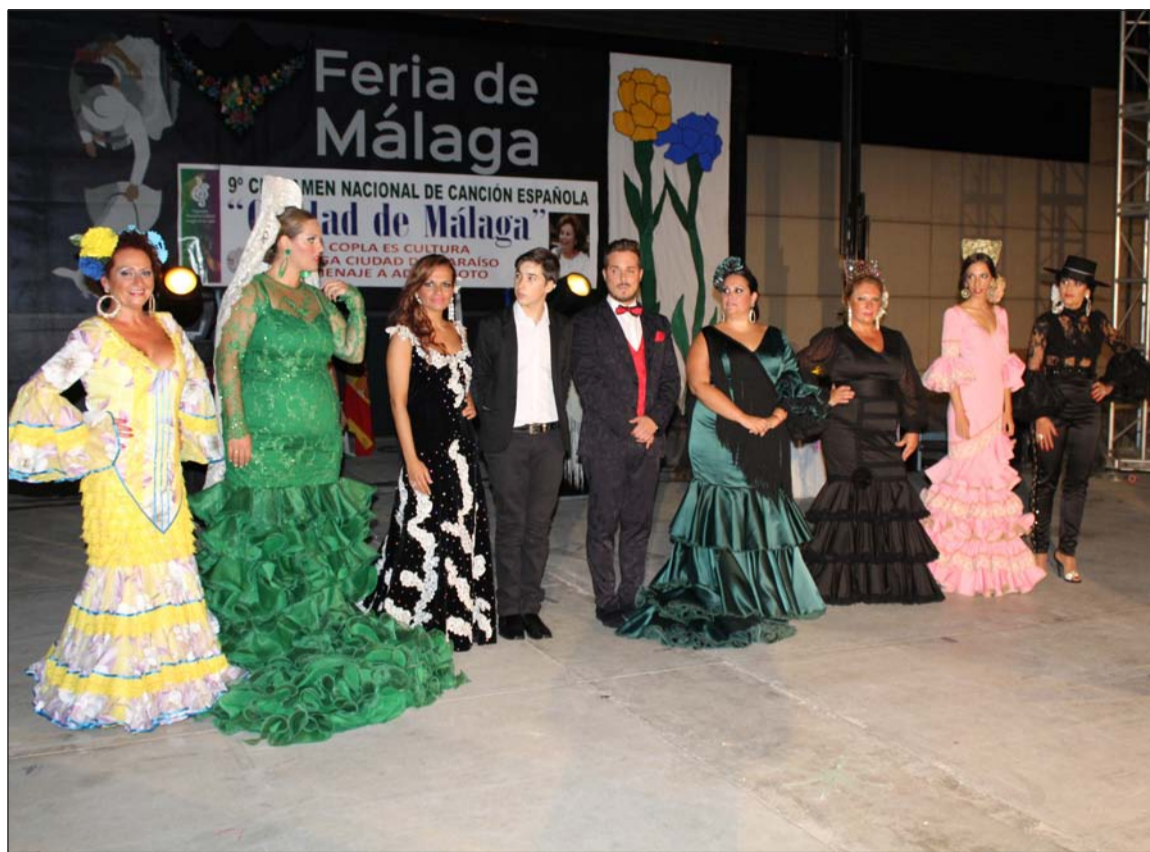
Finalistas del IX Certamen Nacional de Copla 'Ciudad de Málaga' de la Asociación de Amigos de la Copla.

La Agrupación Cultural Telefónica apostaba por un concurso de trajes flamencos en su caseta; mientras que en la de El Parral tenía lugar su segundo Concurso de Charangas.