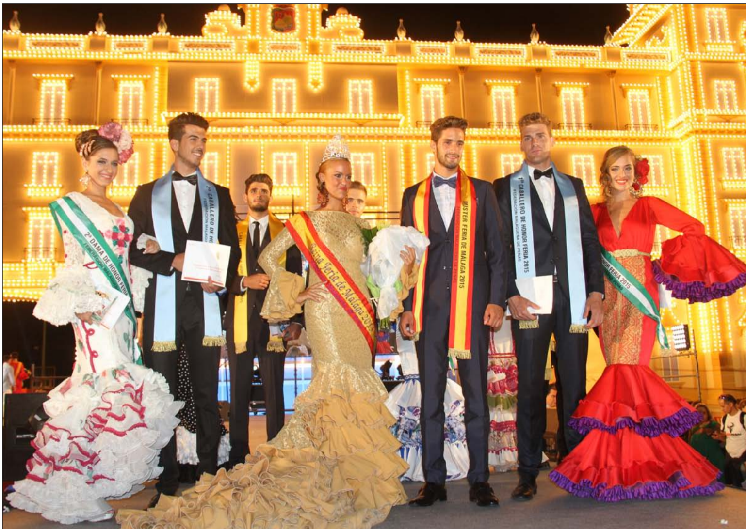
La Reina y el Mister, con sus Damas y Caballeros de Honor.