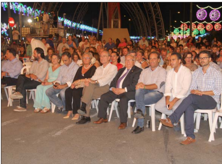
Autoridades presenciando la gala.