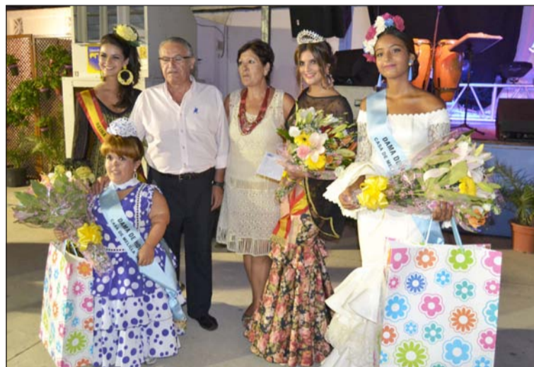
Elección de Reina de la Casa de Melilla en Málaga.