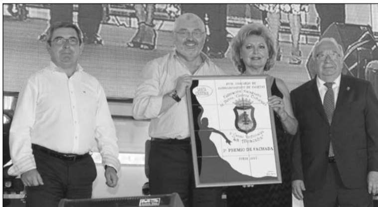
Entrega del premio de fachadas.