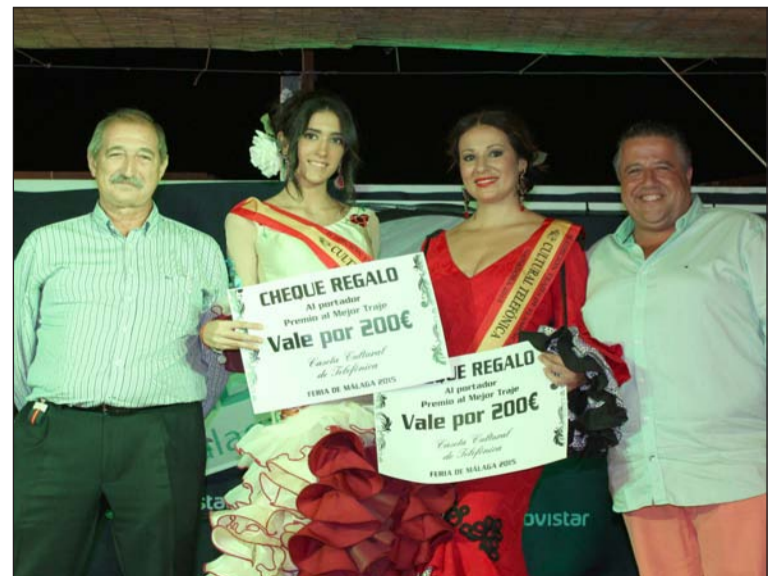
Concurso de Trajes Flamencos de la Agrupación Cultural Telefónica.

También ha habido otras iniciativas importantes, como la celebración de la final del Certamen de Copla de la Asociación de Amigos de la Copla, que el jueves 20 tenía lugar en el Auditorio Municipal con un gran éxito artístico y de público. El triunfo final fue para el artista jienense Ubaldo Valverde.