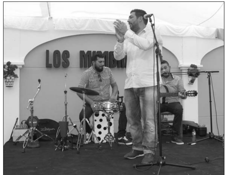
Todos los días se ha contado con actuaciones musicales.

placa cerámica donada por Halcón Viajes, y recaía en la Peña Amigos de los Mimbrales, que ha presentado un completo programa de actividades durante toda la feria, y que ha contado con la participación de numero-