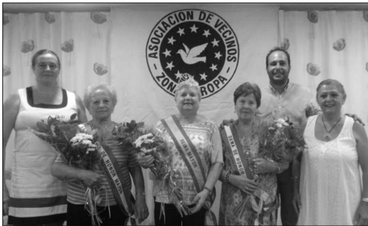
Elección de la Reina Madyor y sus Damas de Honor.