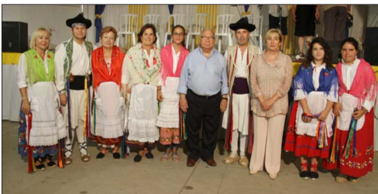
Grupo El Barranco de Almería, de Adra (Almería).