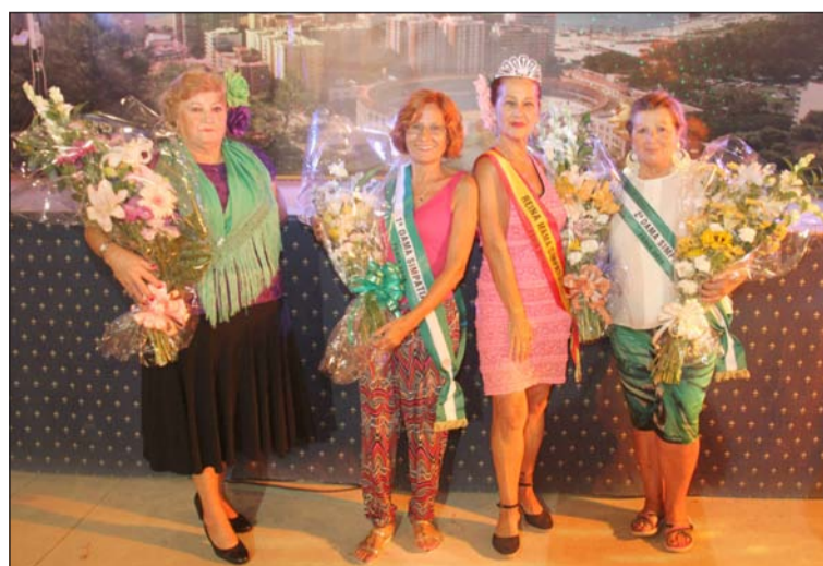
Elección de Reina Mamá de la Peña Simpatía La Luz.