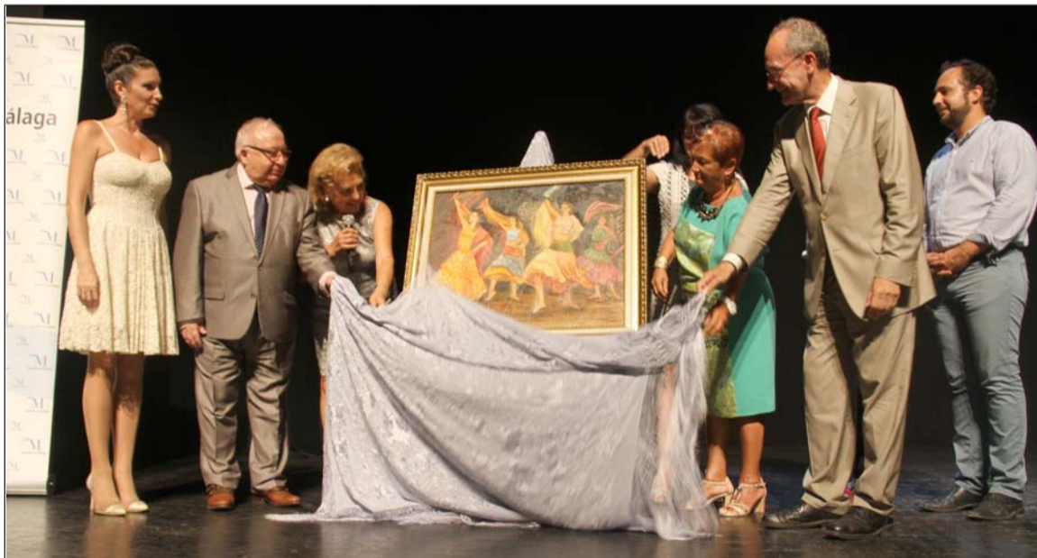
Instante en el que se descubre el cuadro que ilustra el cartel.