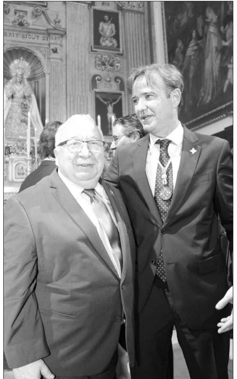
Los presidentes de la Federación de Peñas y la Agrupación de Cofradías.