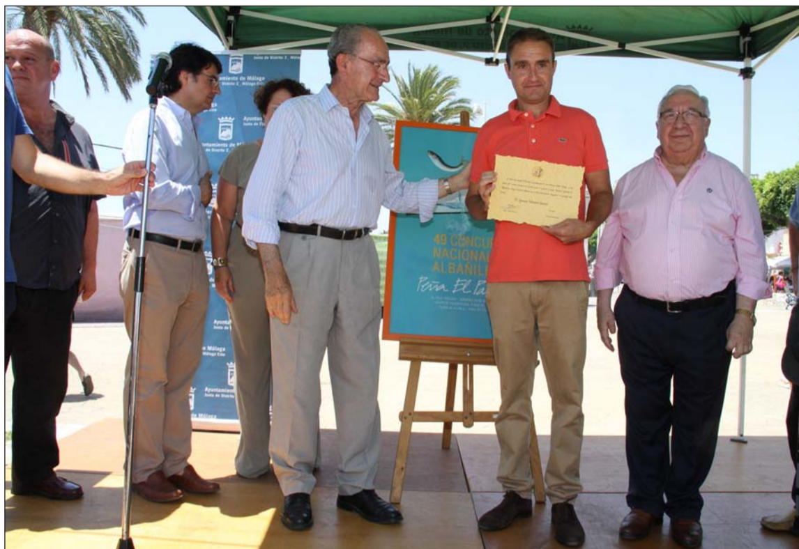
Entrega del primer premio.