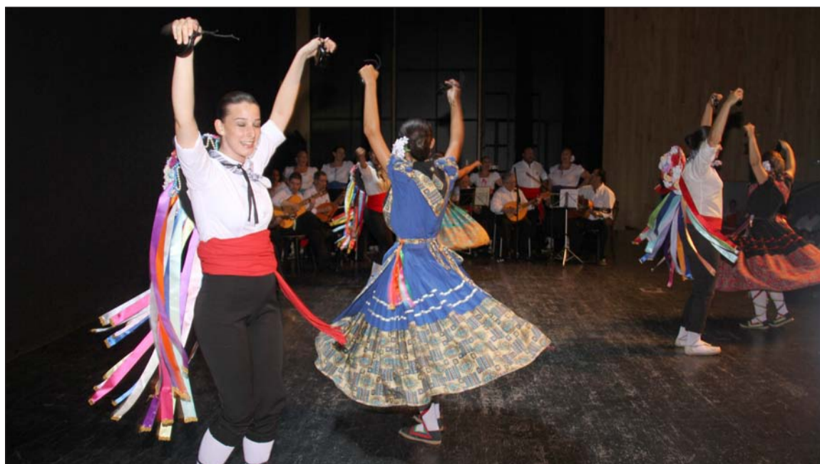
Verdiales durante el acto celebrado en el Auditorio Edgar Neville de la Diputación.