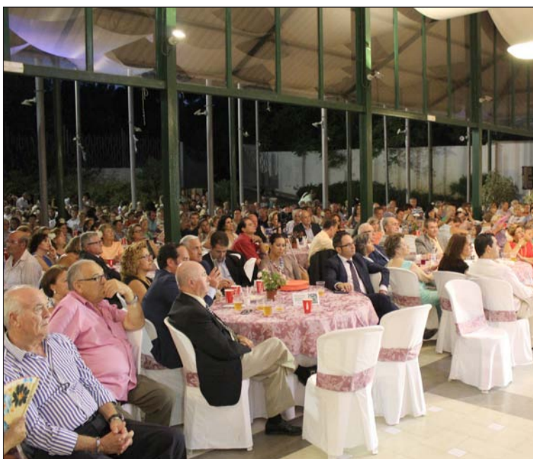
Aspecto que presentaba la Finca La Cónsula.