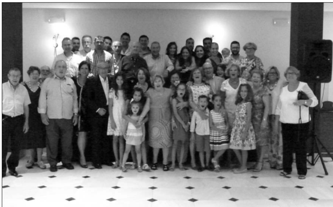
Socios de la entidad en Melilla.

Melilla Puerto, comenzaron a disfrutar del amplio programa de visitas y actividades programadas. La gran variedad de estas ocupó todas las jornadas a los viajeros en un grato viaje que culminó con la Cena de Gala en los salones del Hotel, donde los melillenses rindieron un homenaje en un emotivo acto a la Policía Nacional, con entrega de un cuadro donde plasmaron su afecto a los servicios que prestan estas unidades de grato agradecimiento por los residentes y los que residen fuera de Melilla. La expedición de la Casa de Melilla en Málaga tuvo una presencia muy destacada ya que fue la más numerosa en expedicionarios, superando los cincuenta y con muchos niños que le dieron especial