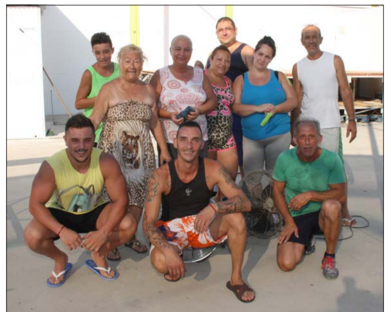
Peñistas de Er Salero en el interior de su caseta.

Una de las que va a estrenar emplazamiento será la de la propia Alcazaba, que se situará en las proximidades de la Caseta Municipal, a la espera de estrenar una estructura definitiva a partir de la edición del 2016.