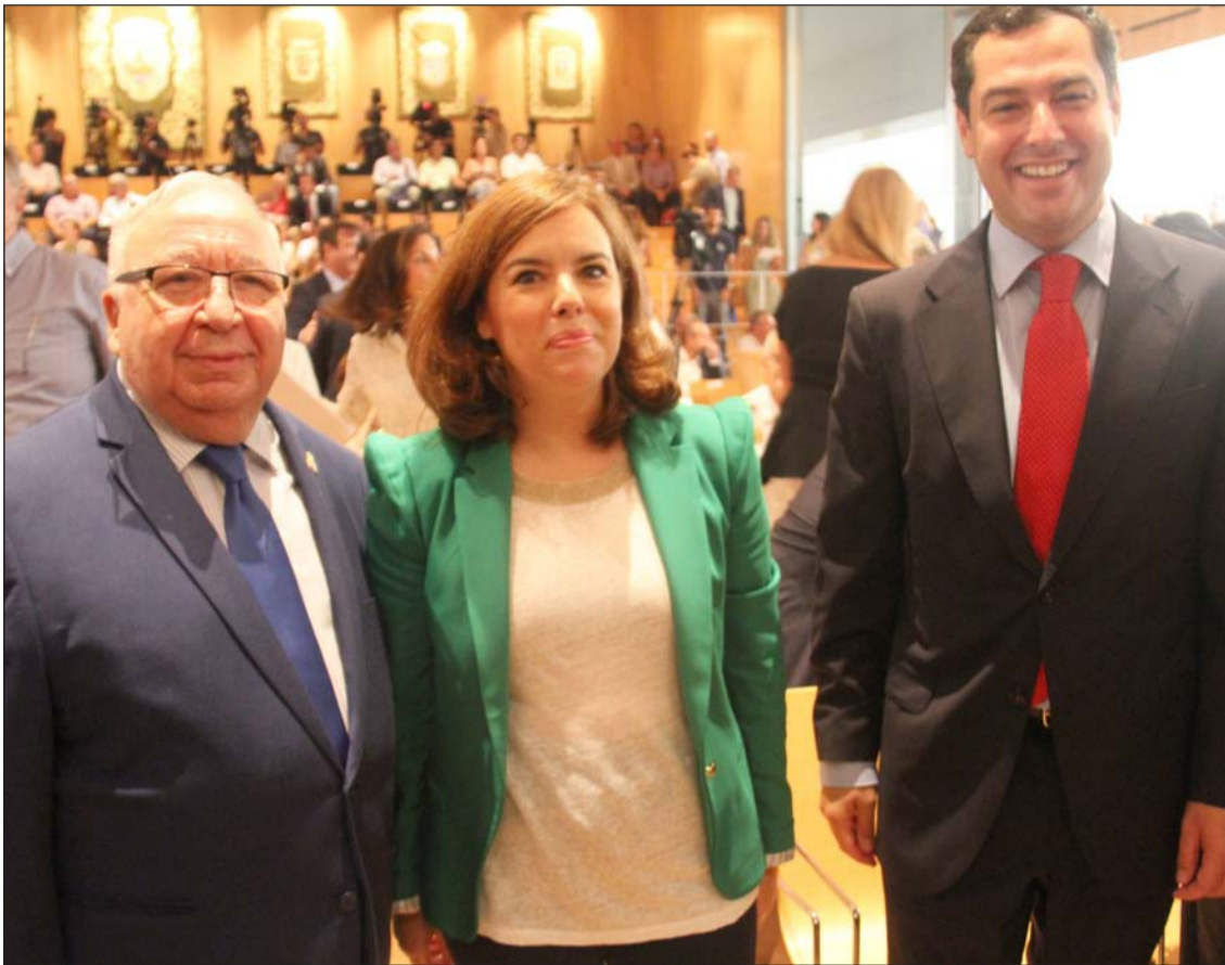
El presidente de la Federación de Peñas, junto a la vicepresidenta Soraya Saénz de Santamaría y Juan Manuel Moreno.

Número 579 29 de Julio de 2015 C/ Pedro Molina, 1 Tfno: 952 22 54 39 Fax: 952 21 48 82 E-mail: prensa@femape.com - la_alcazaba@hotmail.com Web: www.femape.com Edición digital: www.femape.com/laalcazabadigital Twitter: @FMPLaAlcazaba Búsquenos también en Facebook