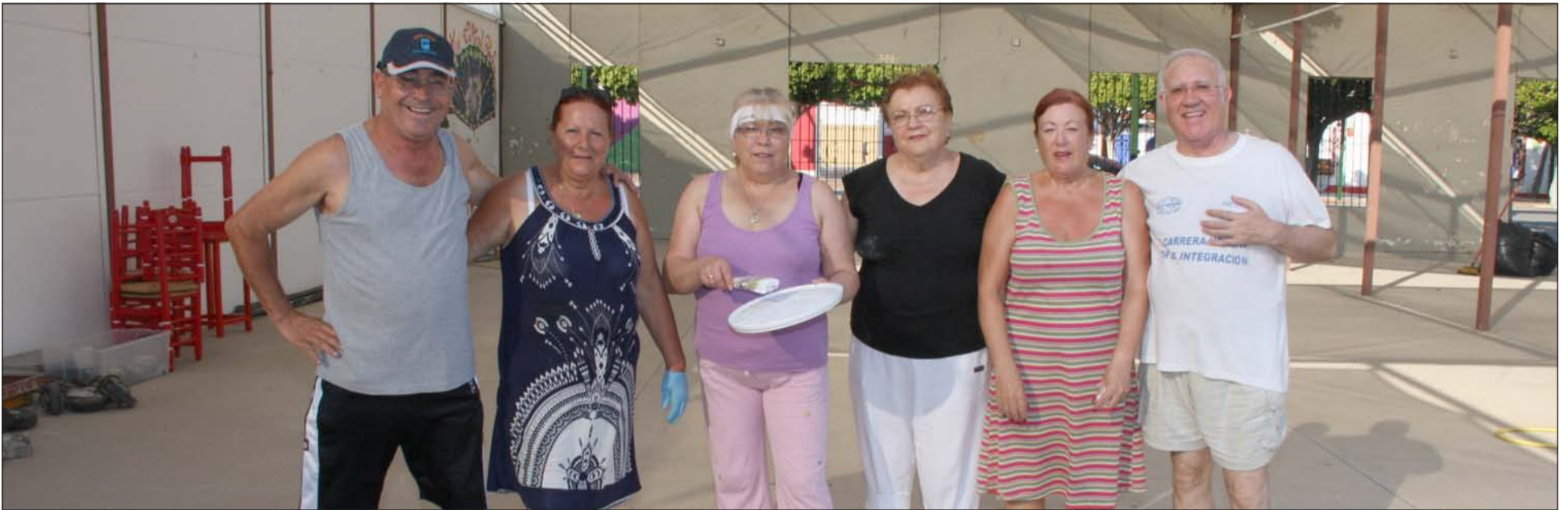
Socios del Centro Cultural Renfe trabajan en el interior de su caseta.