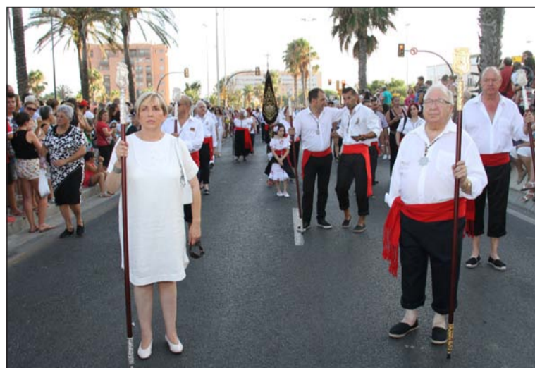
Un instante de la procesión.