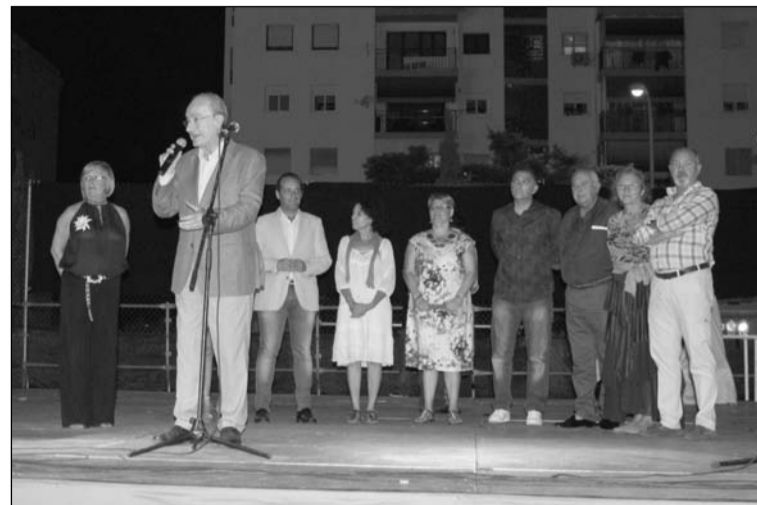
Acto de homenaje a los mayores, con la presencia del alcalde.

cena-homenaje a los mayores del distrito, acompañados por representantes de entidades e instituciones y el Pregón de Feria, a cargo de José Alcaide Bertuchi, presidente de la Pastoral de la Colonia Sta. Inés. Asistió a este acto el alcalde de Málaga, Francisco de la Torre. Estos días de fiesta finalizaron el domingo 19 de julio, con la procesión de la Virgen del Carmen.