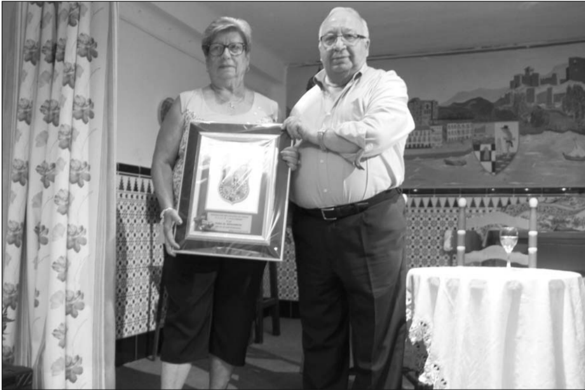
Entrega de un recuerdo por parte del presidente de la Federación.