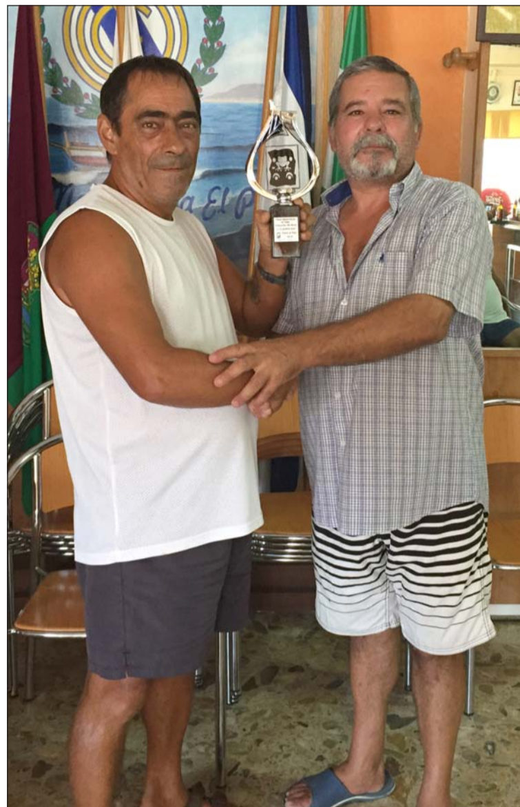
Entrega de trofeo al ganador del Concurso de Rana de la Peña Madridista.

La caseta de la Peña Los Bolaos acogía el miércoles 15 de julio la celebración del Concurso de Dibujo Infantil; que se veía complementado por la Merienda Infantil organizada