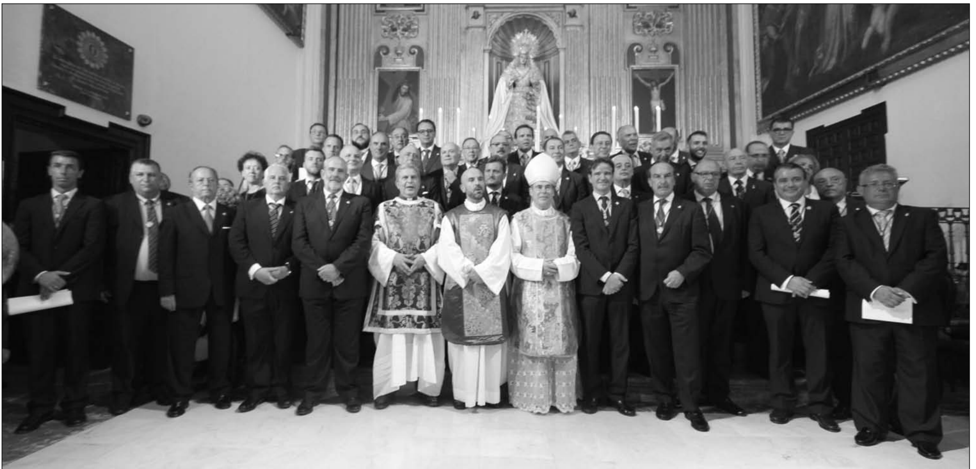
Nueva junta de la Agrupación de Cofradías de Semana Santa.