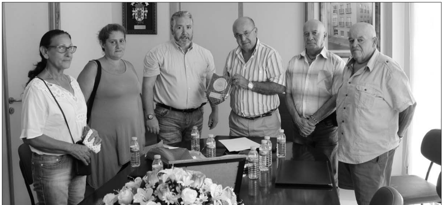
Entrega de una placa por parte de la Asociación a la Federación de Peñas.