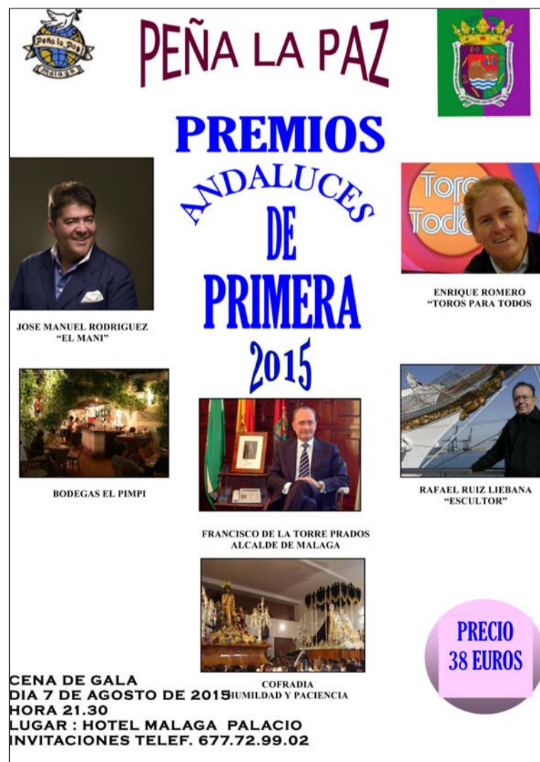
Cartel de esta actividad.

En el apartado político se reconocerá la trayectoria del alcalde Francisco de la Torre; mientras que se ha querido premiar también a la Cofradía de Humildad y Paciencia en el año de su ingreso en la Agrupación de Cofradías.