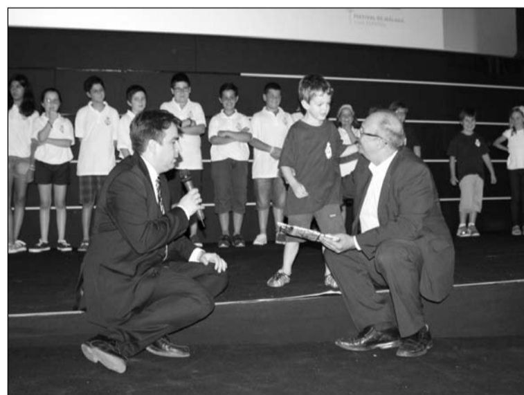
Los niños fueron protagonistas en la presentación.

La Federación Malagueña de Peñas, Centros Culturales y Casas Regionales 'La Alcazaba', Hermana Mayor Honoraria