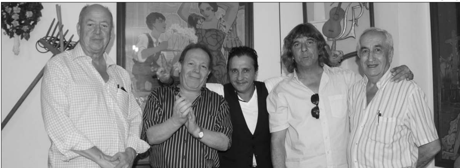
Representantes de la entidad y de la Federación con artistas flamencos.