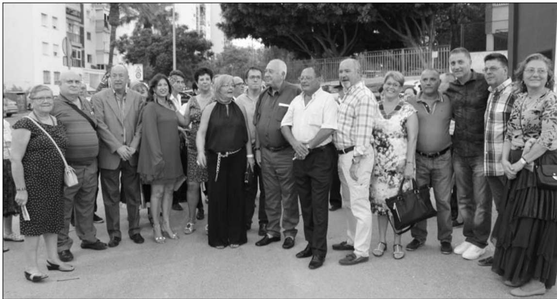
Inauguración de la feria del distrito