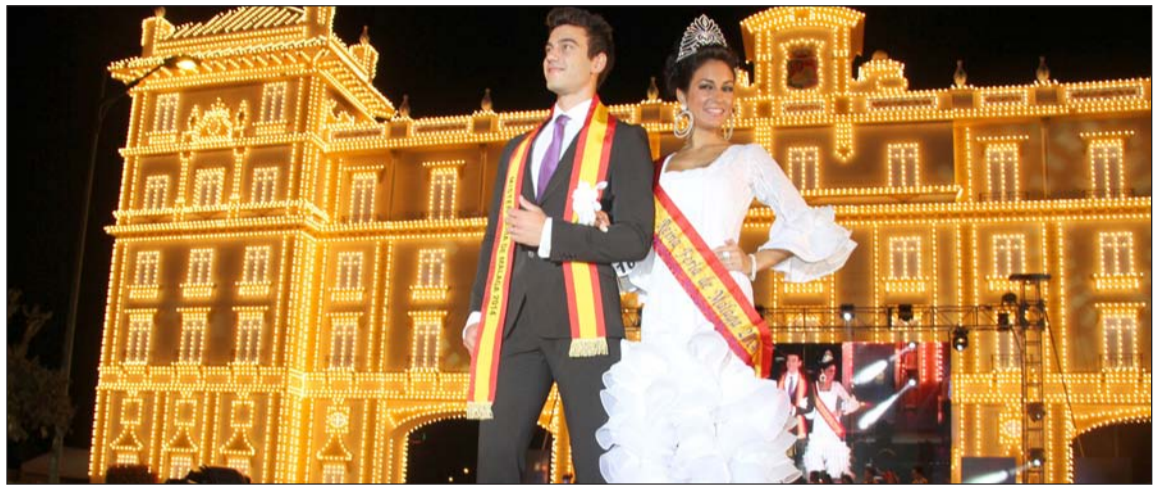
El Mister y la Reina volverán a coronarse en la portada del recinto ferial.

Igualmente, se mantendrán otras actividades tradicionales como los concursos de embellecimiento de casetas, el de ambientación, el de Por Malagueñas, o la entrega de los galardones 'La Alcazaba' y Málaga por bandera'. en fechas próximas se darán a conocer los nombres de los homenajeados de este año.