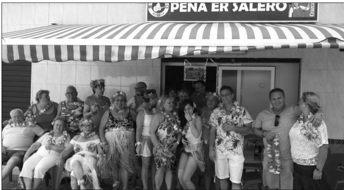
La Peña Er Salero ha dado una vez más buena muestra de la simpatía de sus socios y simpatizantes, realizando una nueva edición de su Comida Hawaiana, para la que los participantes se reunieron y disfrazados de un modo muy especial. Fue una jornada entrañable para los asistentes.