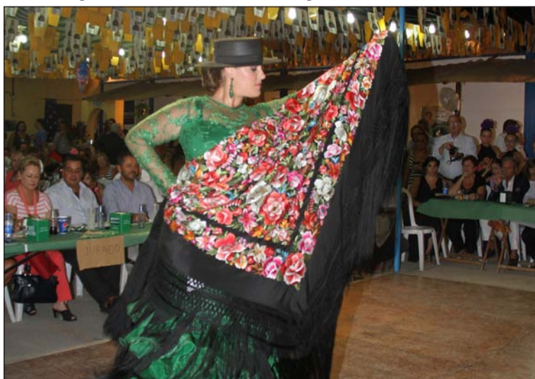
El concurso de mantones se celebrará en la caseta de la Peña Santa Cristina.