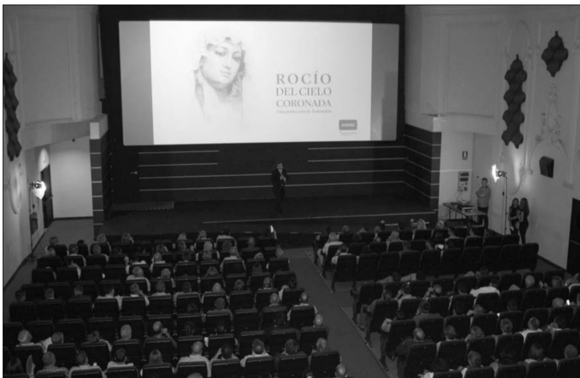
Imagen que presentaba la sala del Cine Albéniz.