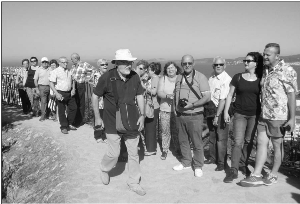
Componentes de la entidad en Vigo.