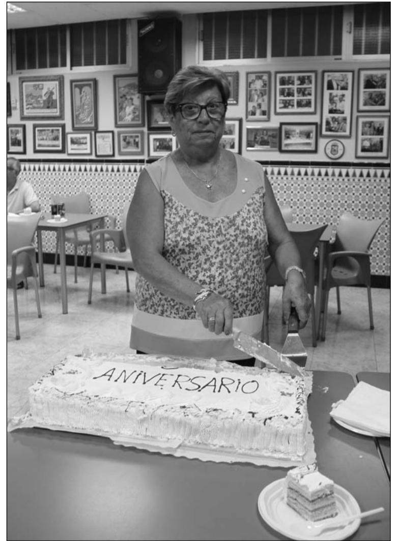
La presidenta parte la tarta del aniversario.

mujeres; aunque la actividad más destacada tenía lugar en la jornada del jueves 16 de julio, festividad de la Virgen del Carmen, cuando se celebraba en su sede de la calle Marqués de Ovieco su 45 Aniversario con tarta y champán.