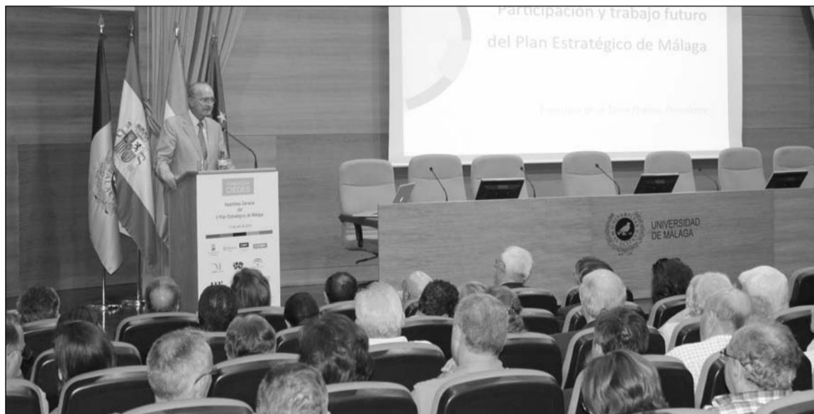
Más de 200 personas respaldaron la Asamblea General de CIEDES.

refería a la importancia de la “cuádruple hélice de la innovación”, es decir, basar los proyectos de futuro sobre la colaboración de cuatro pilares: empresarios, administraciones, universidad y sociedad, un modelo que viene combinando la Fundación desde su puesta en marcha hace 21 años. Al respecto, el alcalde hablaba de la necesidad de identificar agentes y microclúster en las cuatro líneas estratégicas que marca el II PEM, “con el fin de dar a conocer las tendencias europeas