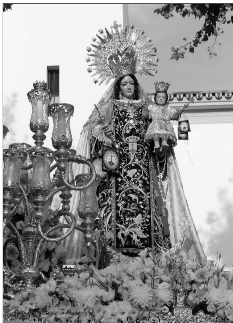
Imagen de la Virgen del Carmen de Pedregalejo.

Una vez desembarcada la Imagen, se reanudaba la procesión terrestre.