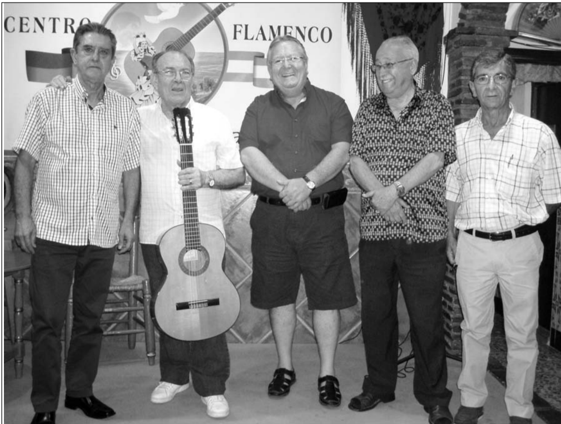
El artista flamenco, acompañado por socios de la entidad.