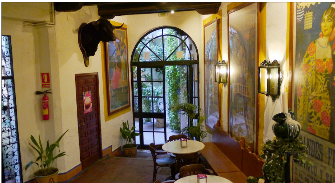
El Pimpi cuenta con una decoración de marcado carácter taurino.