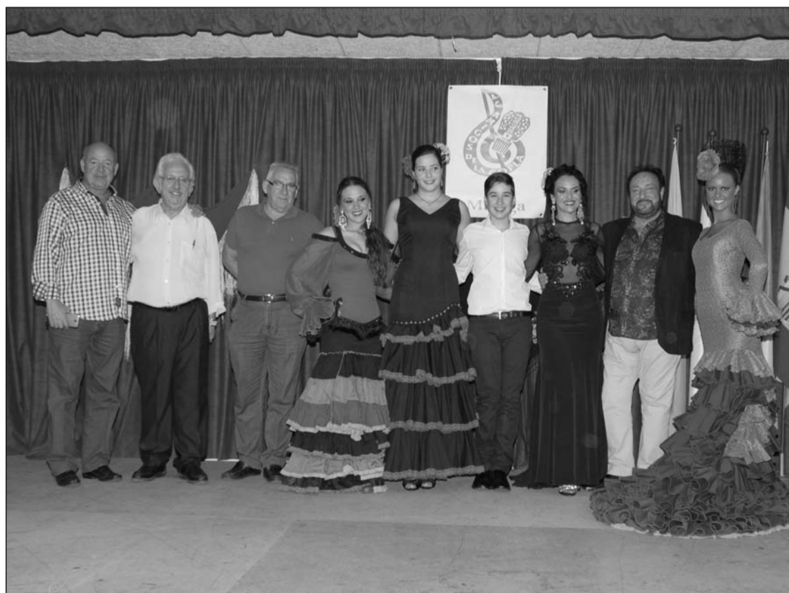
Imagen de una de las semifinales.