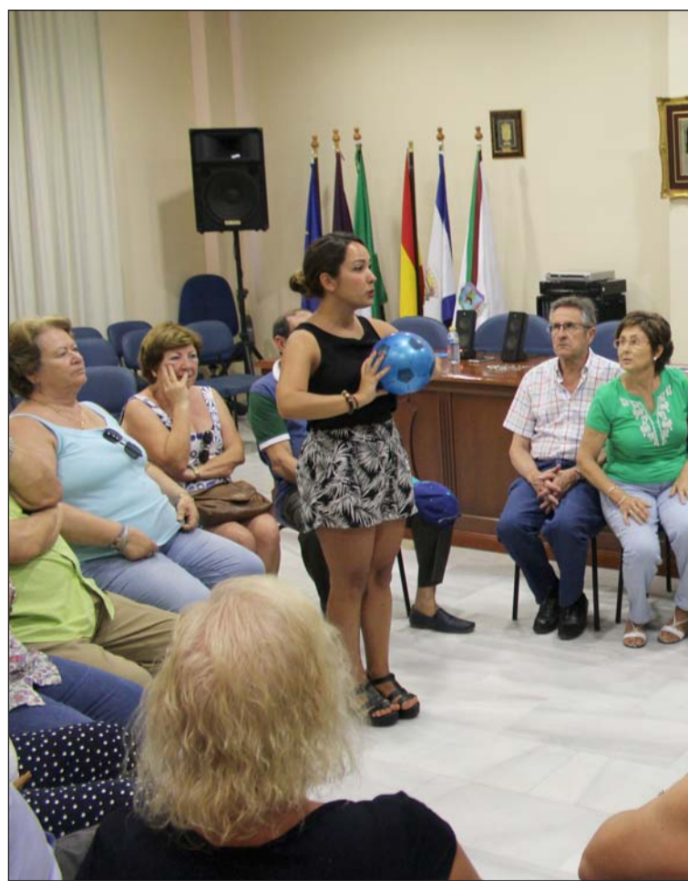
Una de las monitoras explica uno de los ejercicios.