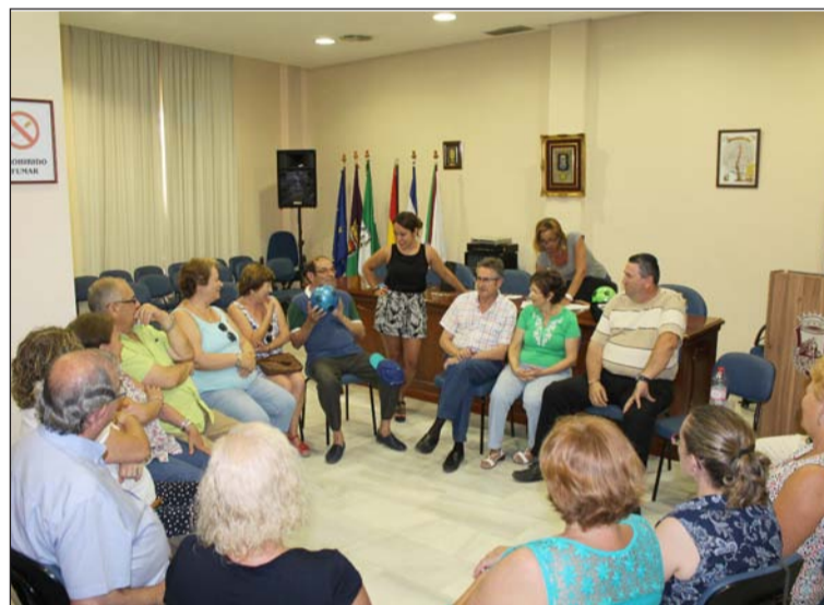
Un instante del taller.

El curso estuvo limitado a treinta personas, que desarrollaron este taller impartido por técnicos especialistas en la materia; resultando muy satisfactorio para los inscritos.