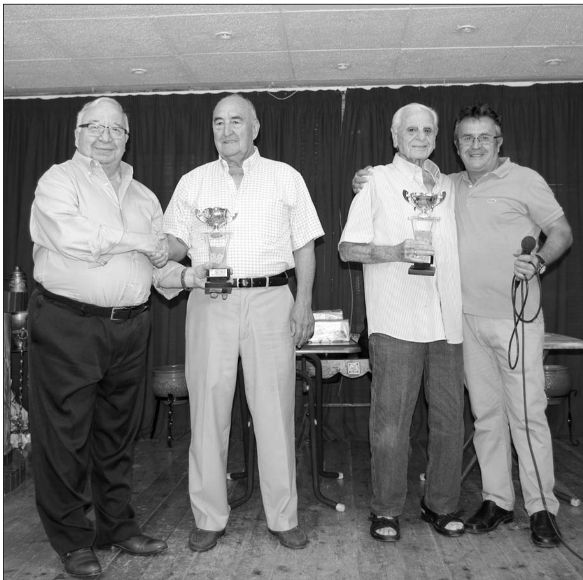
Entrega de trofeos del campeonato de dominó.