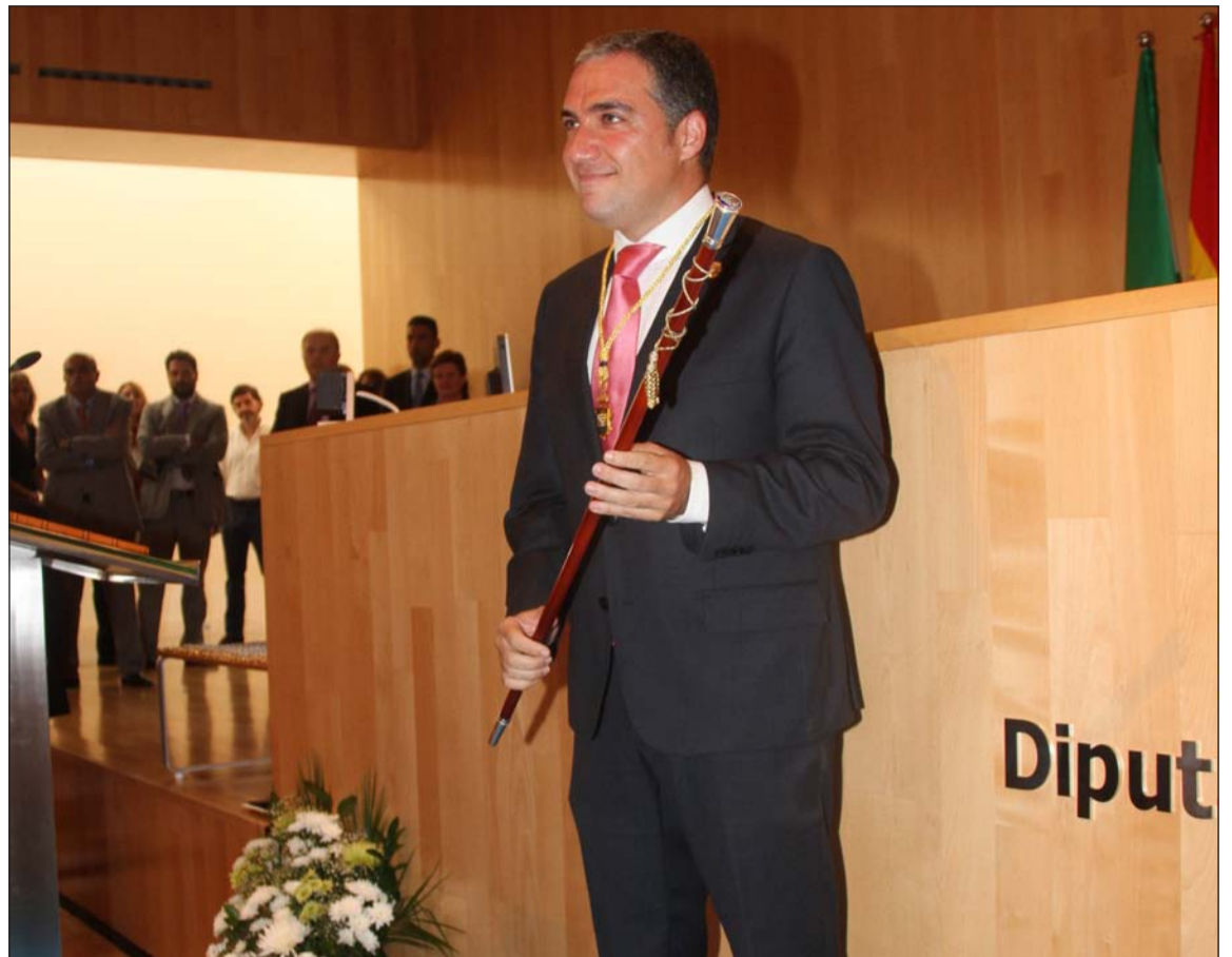
Toma de posición de Elías Bendodo.

Durante su primera intervención como presidente de la Diputación en esta legislatura, Bendodo quiso recalcar que la institución que nuevamente preside “será un referente de la buena gestión”. De hecho, preside la Diputación con mayor presupuesto y una de las de mayor tamaño que gobierna el PP, y eso “nos confiere una especial visibilidad, liderazgo y responsabilidad”.