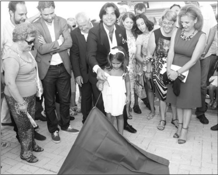
Instante en el que se descubre la loseta.