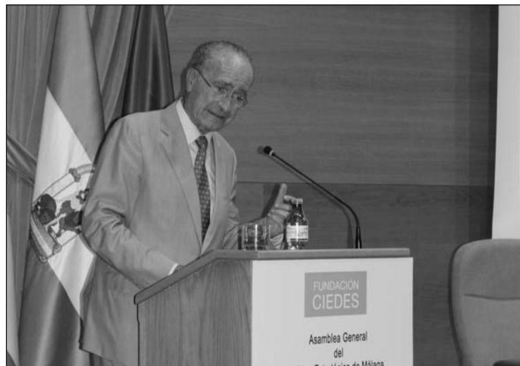
Intervención del alcalde.

Con motivo de la Feria, la sede de la entidad permanecerá cerrada desde el sábado 8 hasta el miércoles 26 de agosto, ambos inclusivos.