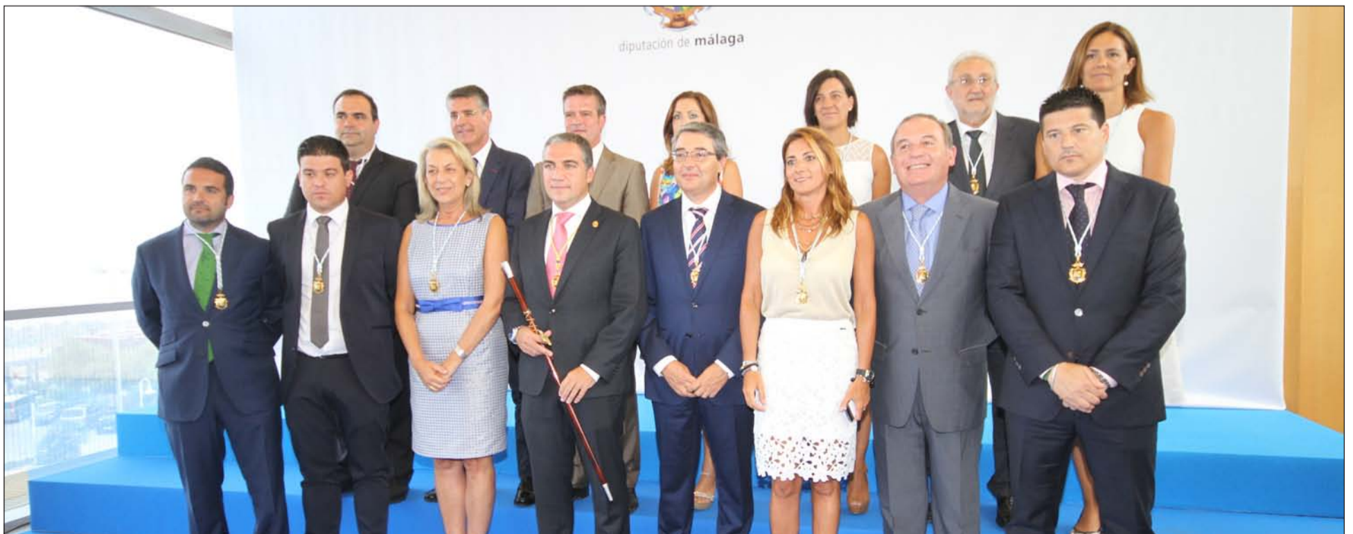
Equipo de gobierno de la Diputación.

No obstante, entre todos los retos planteados, Bendodo considera que el más importante de ellos es liderar la creación de empleo. Por ello, “todas nuestras políticas se van a dirigir al empleo y vamos a crear una potente área de economía productiva”.