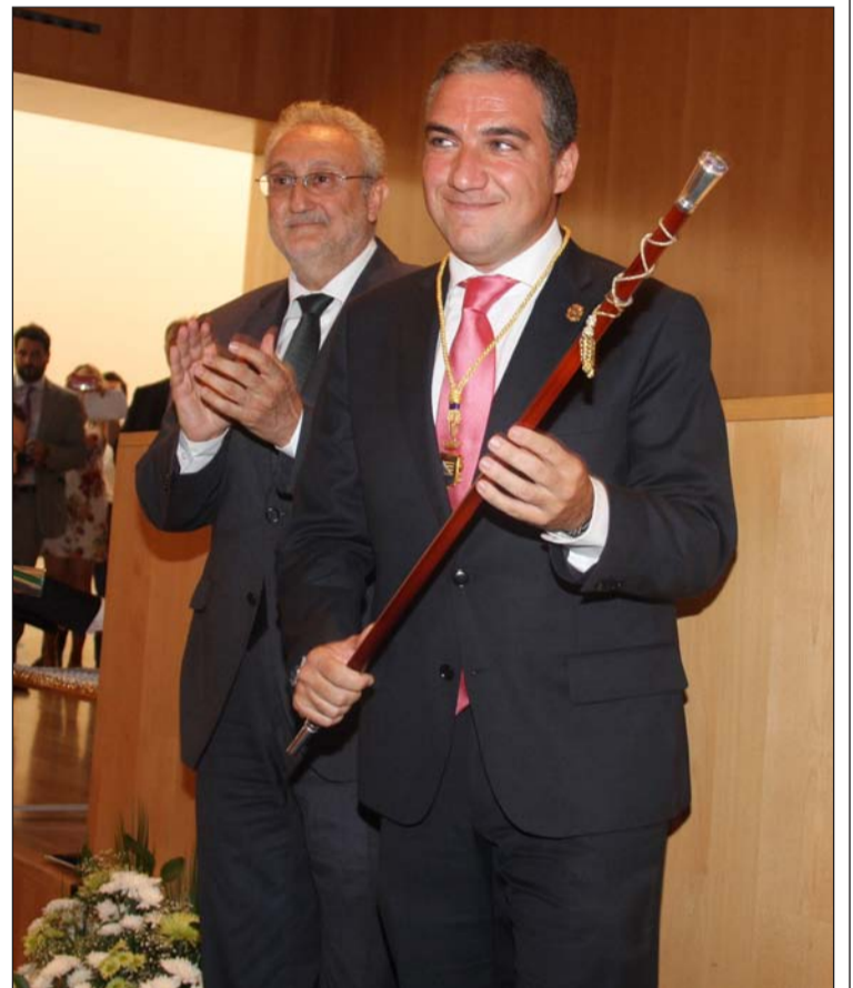
Toma de posesión de Elías Bendodo como presidente de la Diputación.