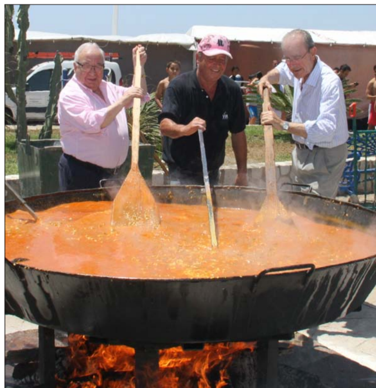
Paella popular del distrito organizada por la Peña El Palustre.