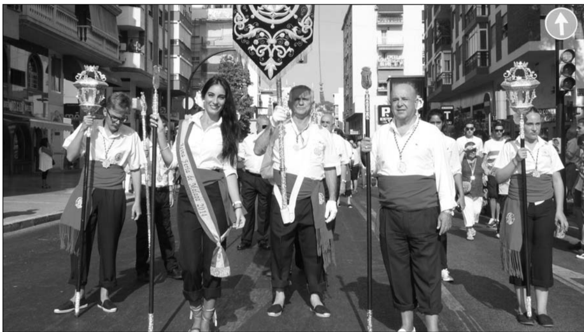
Representación peñista en la presidencia de la procesión.