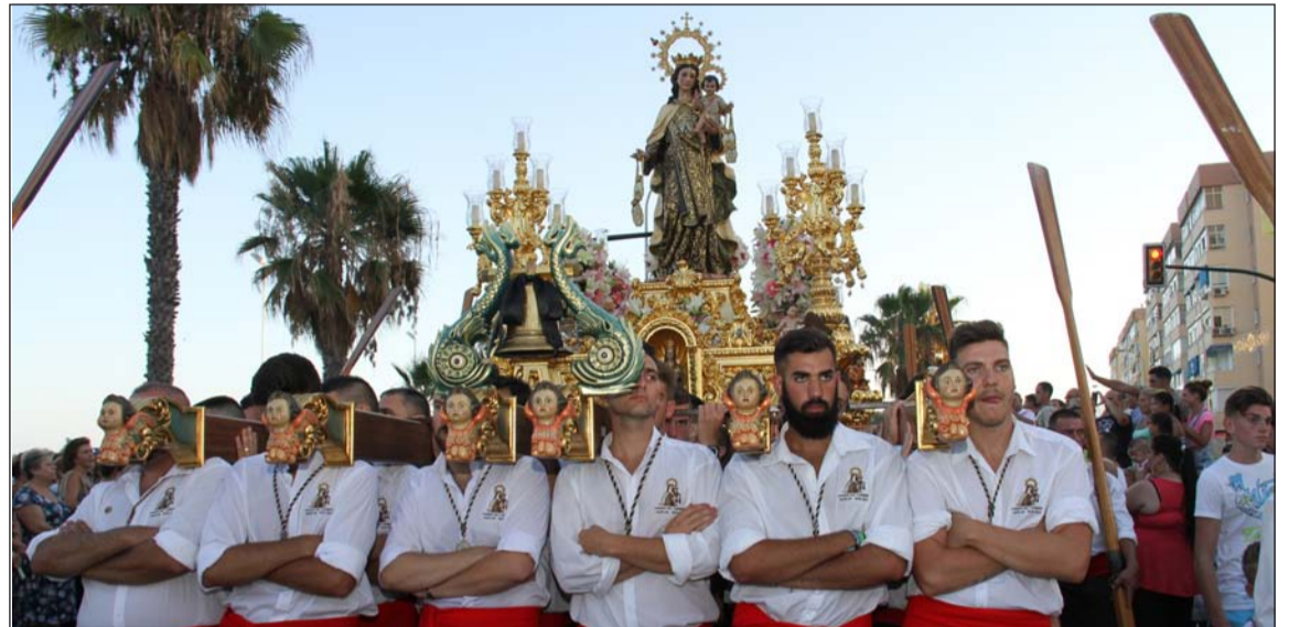
La Virgen del Carmen, en su trono procesional.

Finalmente el 19 de julio, antes de la procesión vespertina, se celebraba por la mañana Diana Floreada y Pasacalles por el barrio.