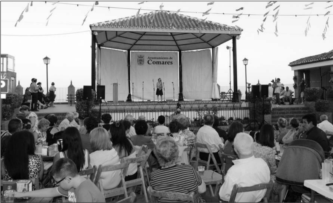
Aspecto que presentaba la plaza durante el espectáculo.