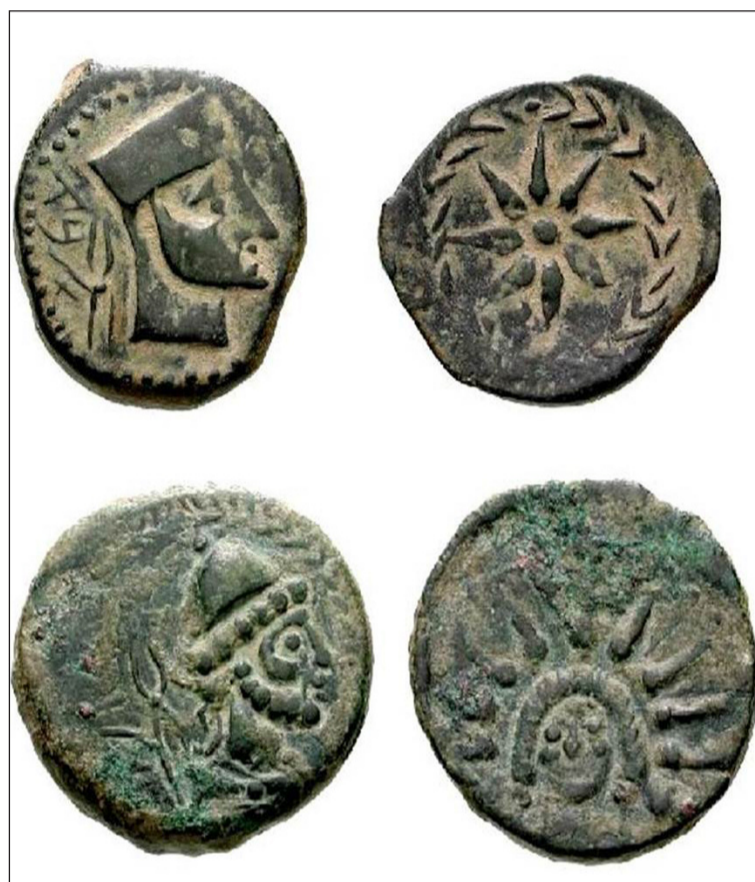
Monedas fenicias localizadas en una excavación en Málaga.

La primera actividad está fechada para el día 22 de septiembre próximo. La cita será en la sede de la Federación Malagueña de Peñas a las 11