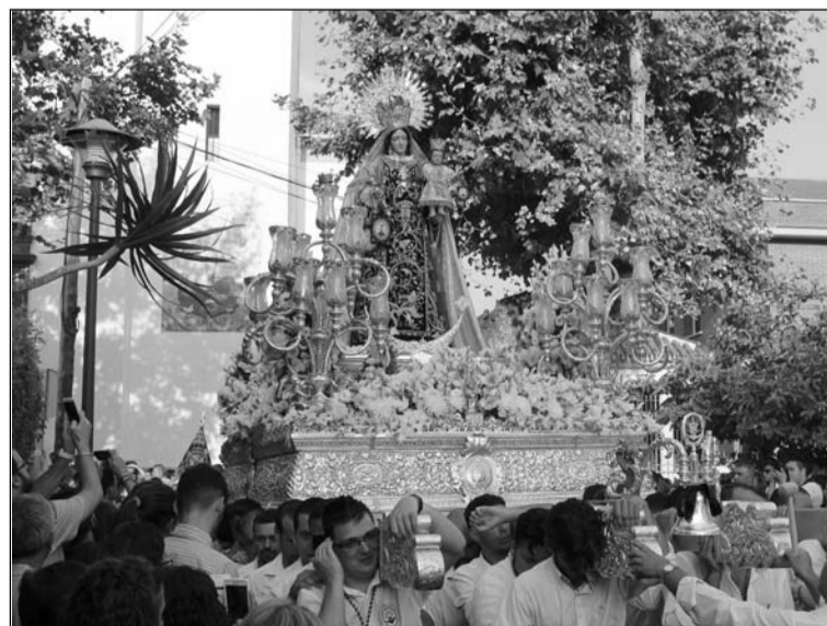
Un instante de la procesión