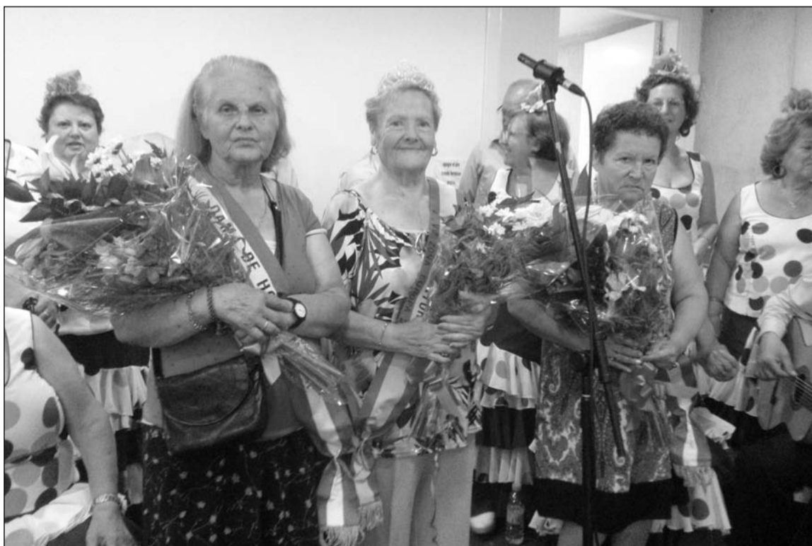
Imagen de archivo del Día del Mayor del pasado año.

años dentro de la Feria de Málaga, concretamente el 15 de agosto, con el fin de que los mayores puedan disfrutar de un día de Feria en el barrio, donde se elige a la reina de la Fiesta del Mayor, y sus damas de honores. Así, está previsto que más de 150 mayores almuercen en la sede social y disfruten de la actuación de coros rocieros para parar un gran día de confraternidad.