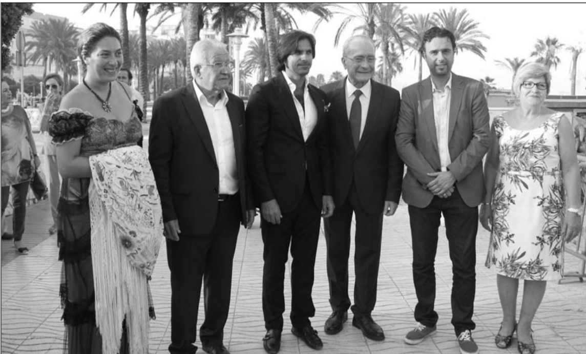
Acto de reconocimiento al matador de toros.