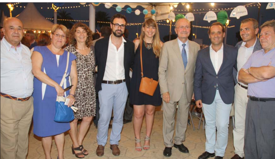
Inauguración de la Feria de El Palo, con autoridades y representantes de la Federación de Peñas.

La Federación Malagueña de Peñas estuvo representada el pasado lunes 13 de julio en el pleno constituyente de la Diputación Provincial de Málaga, en el que resultaba reelegido presidente Elías Bendodo con los votos a favor del Partido Popular y de Ciudadanos.