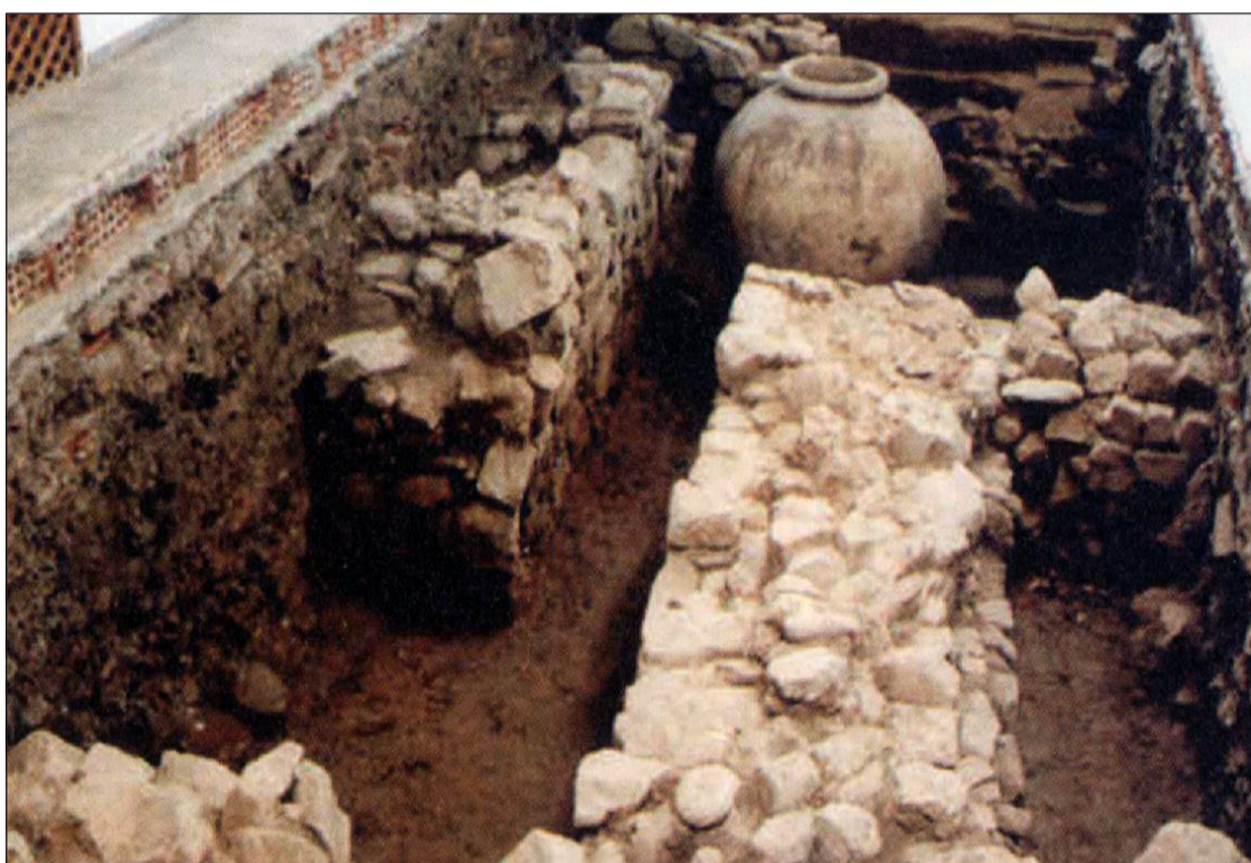
Restos fenicios en la ciudad de Málaga.