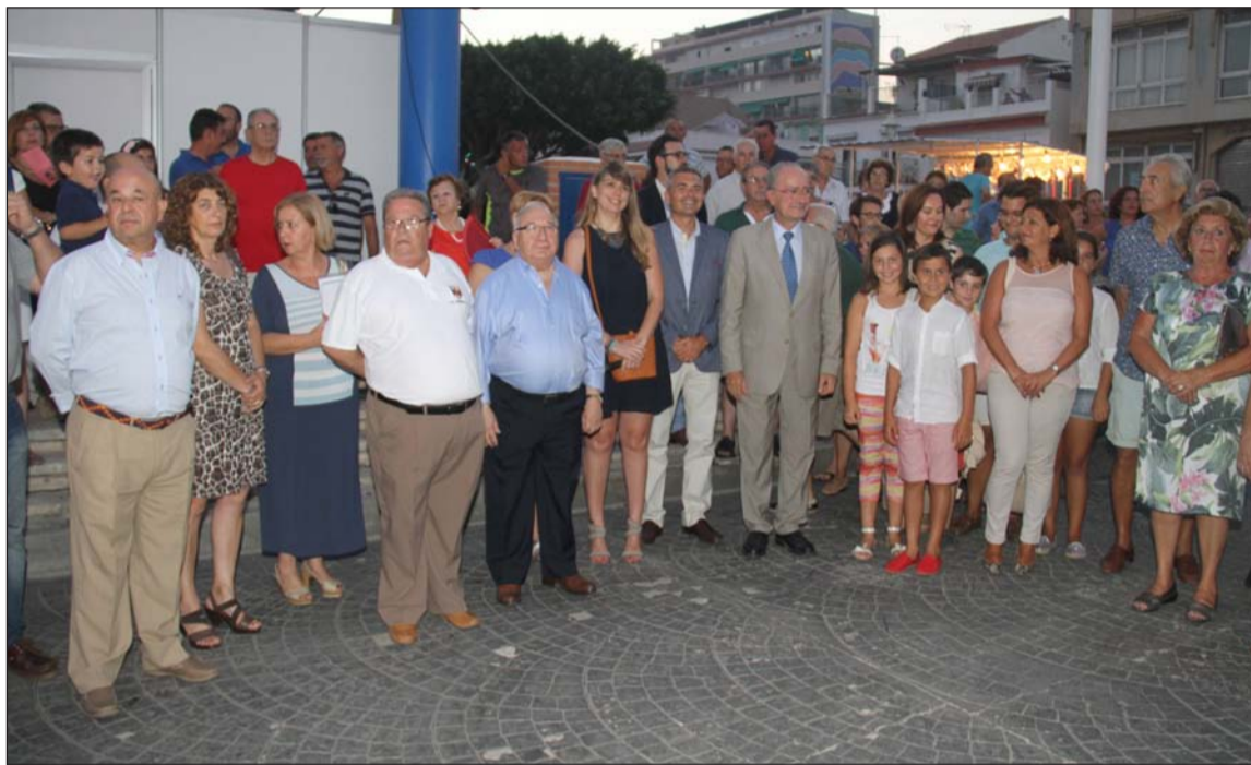
Acto de inauguración de la Feria de El Palo.