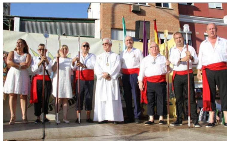
Socios de la Peña Costa del Sol, directivos de la Federación, el alcalde y el sacerdote.