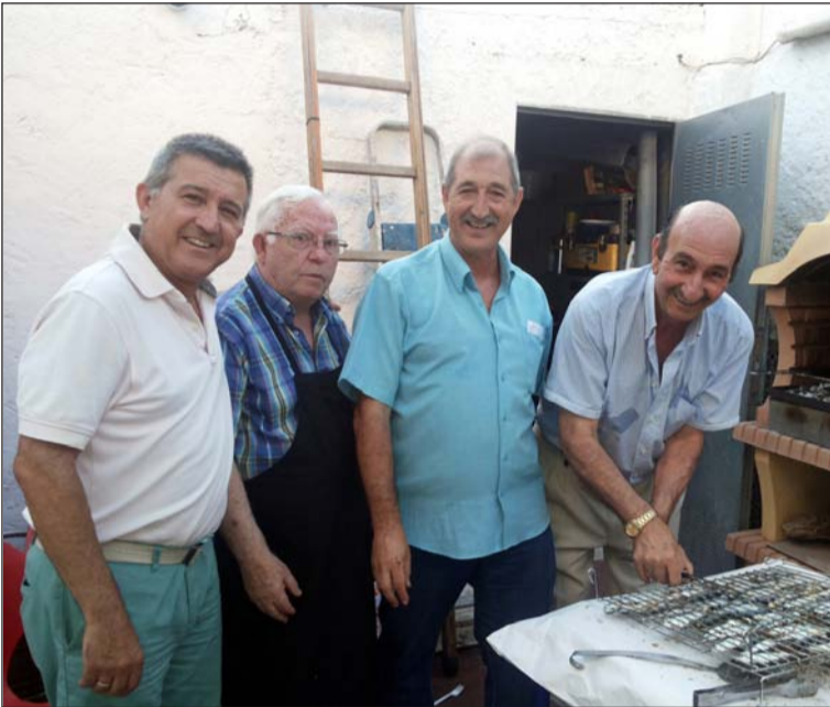
Preparativos de las sardinas.