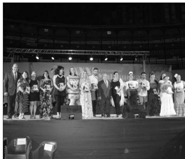
Reuerdo para los profesores de baile.