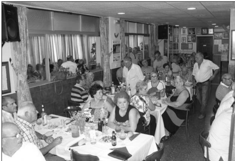
Mariscada celebrada en la Peña Ciudad Puerta Blanca.

La Peña Ciudad Puerta Blanca, una entidad perteneciente a la Federación Malagueña de Peñas, Centros Culturales y Casas Regionales 'La Alcazaba', celebraba el pasado sábado 4 de julio al mediodía su tradicional Mariscada, en la que se daban cita socios y simpatizantes para degustar diferentes manjares como gambas cocidas, pulpo a la gallega, boquerones en vinagre, conchas finas, mejillones, cigalas, patas, langostinos y gazpacho.