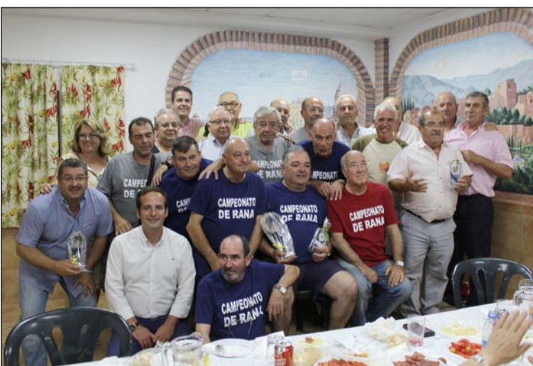
Los ganadores con sus trofeos.