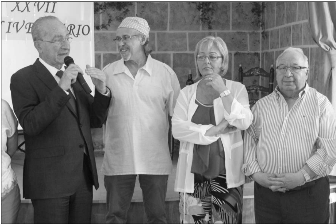
Intervención del alcalde.