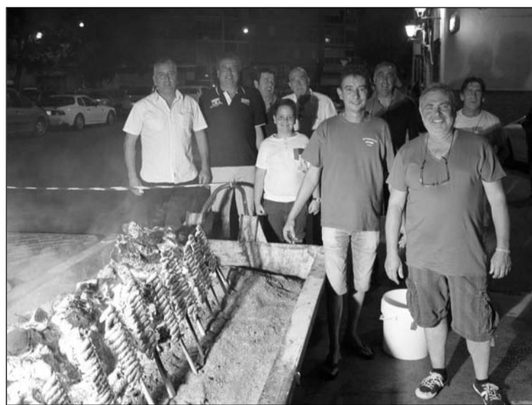
Socios preparando los espetos.

De este modo, la actividad se celebraba en el exterior de su sede, donde se prepararon espetos de sardinas que fueron degustados por todos los asistentes.