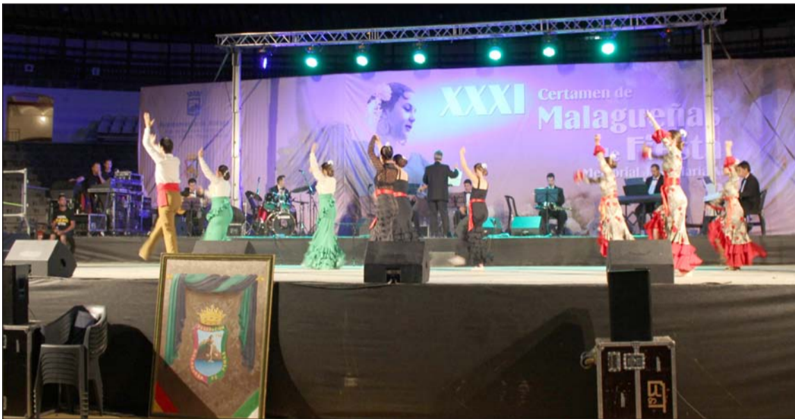
Inicio del espectáculo con el baile de la Malagueña de Lecuona.