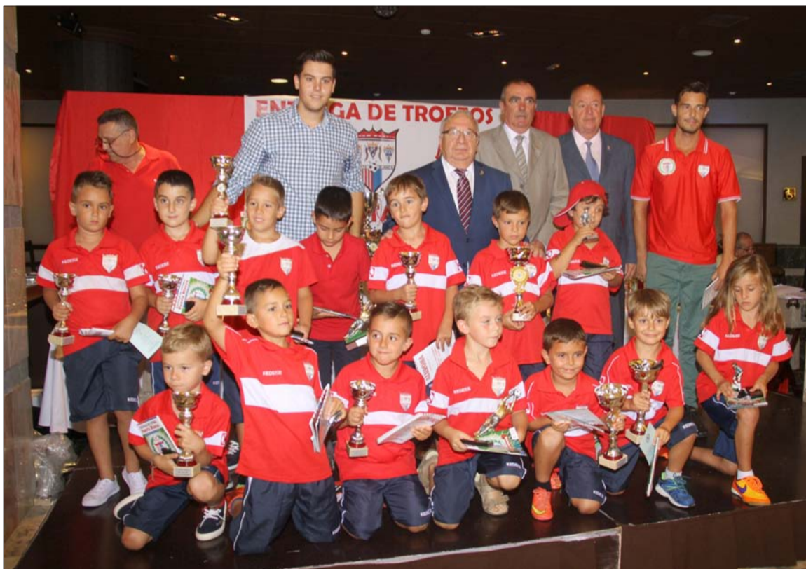
Uno de los equipos premiados.