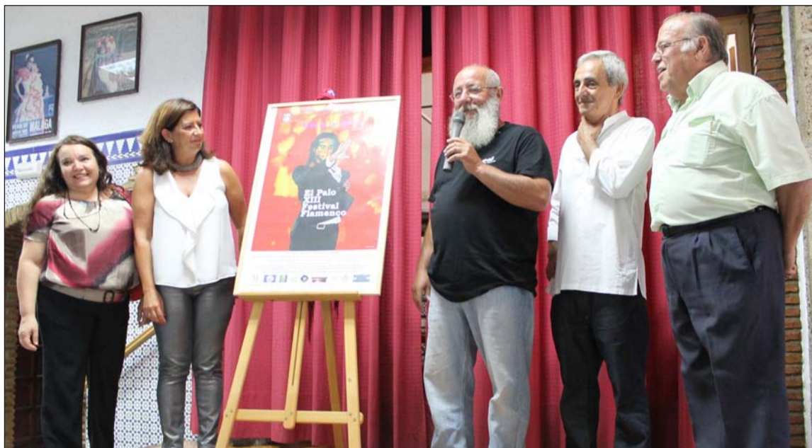
Presentación del cartel en la sede de la Peña El Palustre.