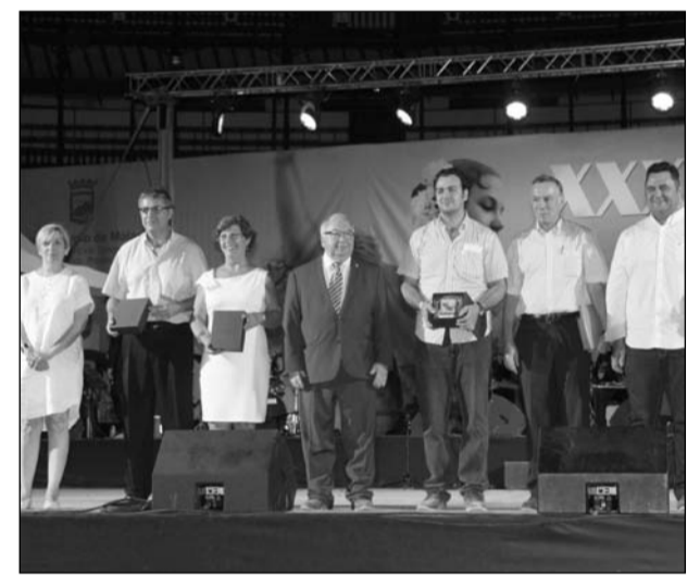
Reuerdo a los componentes del jurado.