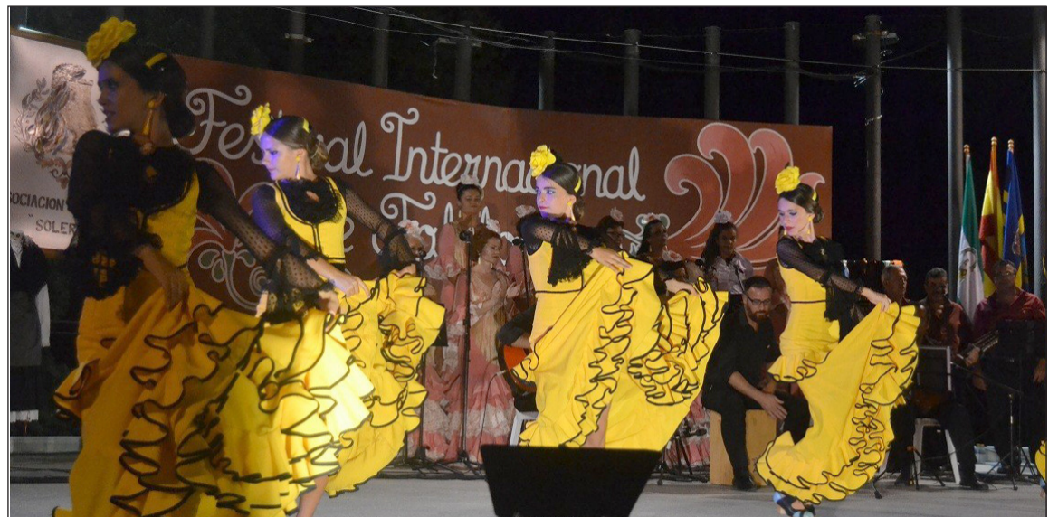
Una de las actuaciones.

En este evento se contó con la participación del Grupo Voces y Esparto, de Cuenca; la Asociación Folclórica 'Abenechara', de Valle-seco (Las Palmas de Gran Canaria); el Coro Municipal 'La Alegría', de Alhaurín de la Torre; así como el propio Grupo Folclórico Solera.