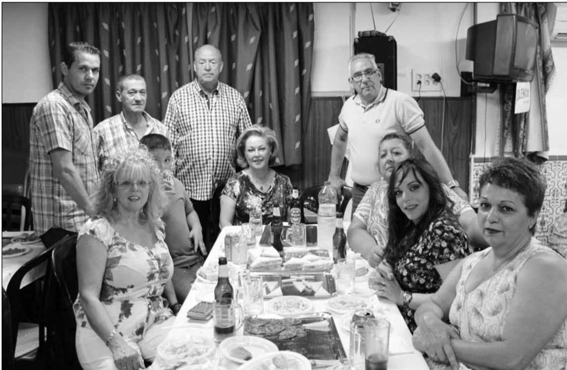
Directivos de la Peña Santa Marta con representantes de otras entidades y de la Federación de Peñas.