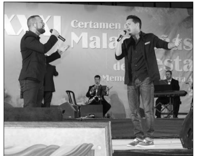
Grupo Por Derecho.