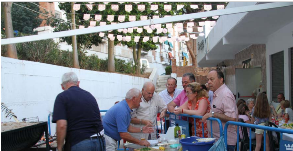
Exterior de la sede, donde se prepararon los espetos.