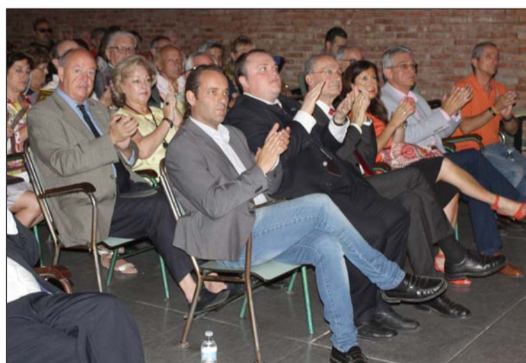
Autoridades presentes en el acto.

Con estos premios, desde esta entidad federada se pretende reconocer la labor de forma voluntaria por los demás en diferentes apartados. El acto estuvo acompañado de diferentes actuaciones musicales, entre ellas la del propio coro de la asociación.