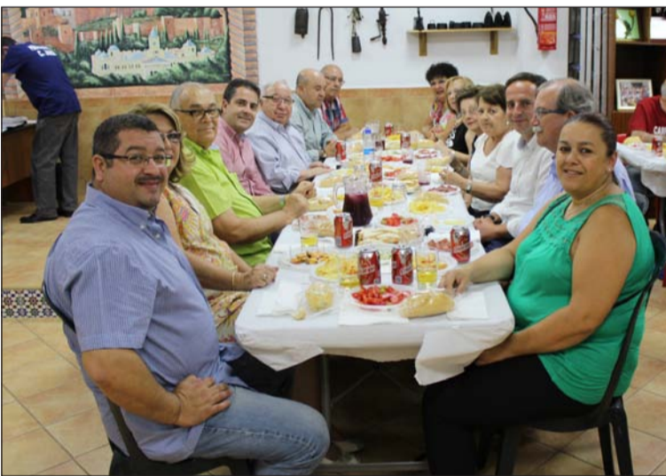
Mesa presidencial durante la comida.

sede de esta última entidad, en la calle Quintanar de la Orden, el acto de entrega de trofeos; contándose con la presencia de representantes municipales, de las entidades participantes, y de la Federación Malagueña de Peñas, Centros Culturales y Casas Regionales 'La Alcazaba'.