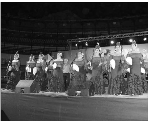
Coro Aires de Torremolinos.