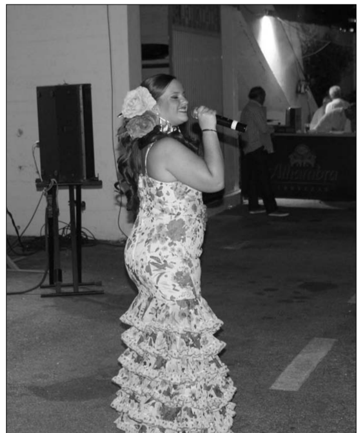
La Peña Jardín de Málaga celebraba el día 23 de junio su tradicional 'Sardiná', coincidiendo con la víspera de San Juan. Con tal motivo se celebraba una veladilla en la que no faltaron las actuaciones musicales.