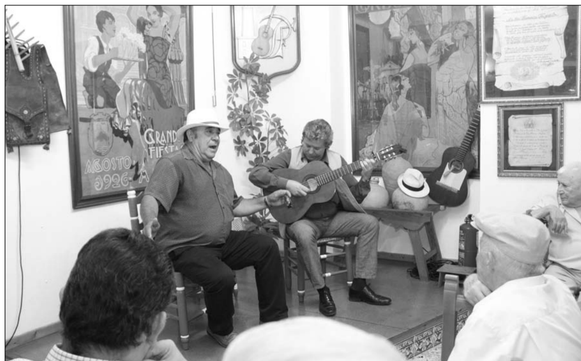
Un instante del recital.

De este modo, los asistentes pudieron disfrutar de una actuación flamenca de primer nivel que deleitó a todos los socios de esta entidad perteneciente a la Federación Malagueña de Peñas, Centros Culturales y Casas Regionales 'La Alcazaba'.