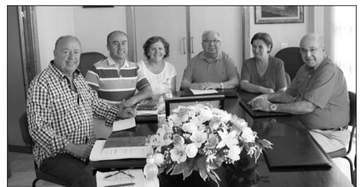
La sede de la Federación Malagueña de Peñas acogía la pasada semana la visita de representantes de la Asociación Flor de Azahar, que fueron recibidos por el presidente y miembros de su directiva.