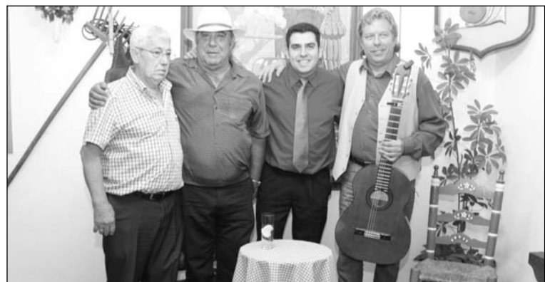
Componentes de la entidad con artistas flamencos.