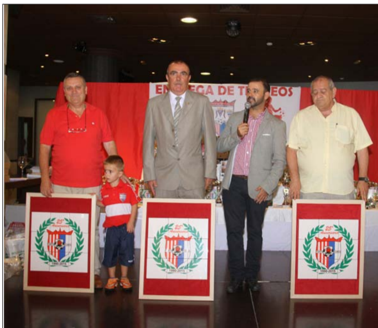
Acto de entrega de trofeos.