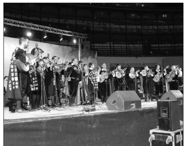
Tuna de Ingeniería Técnica Industrial.