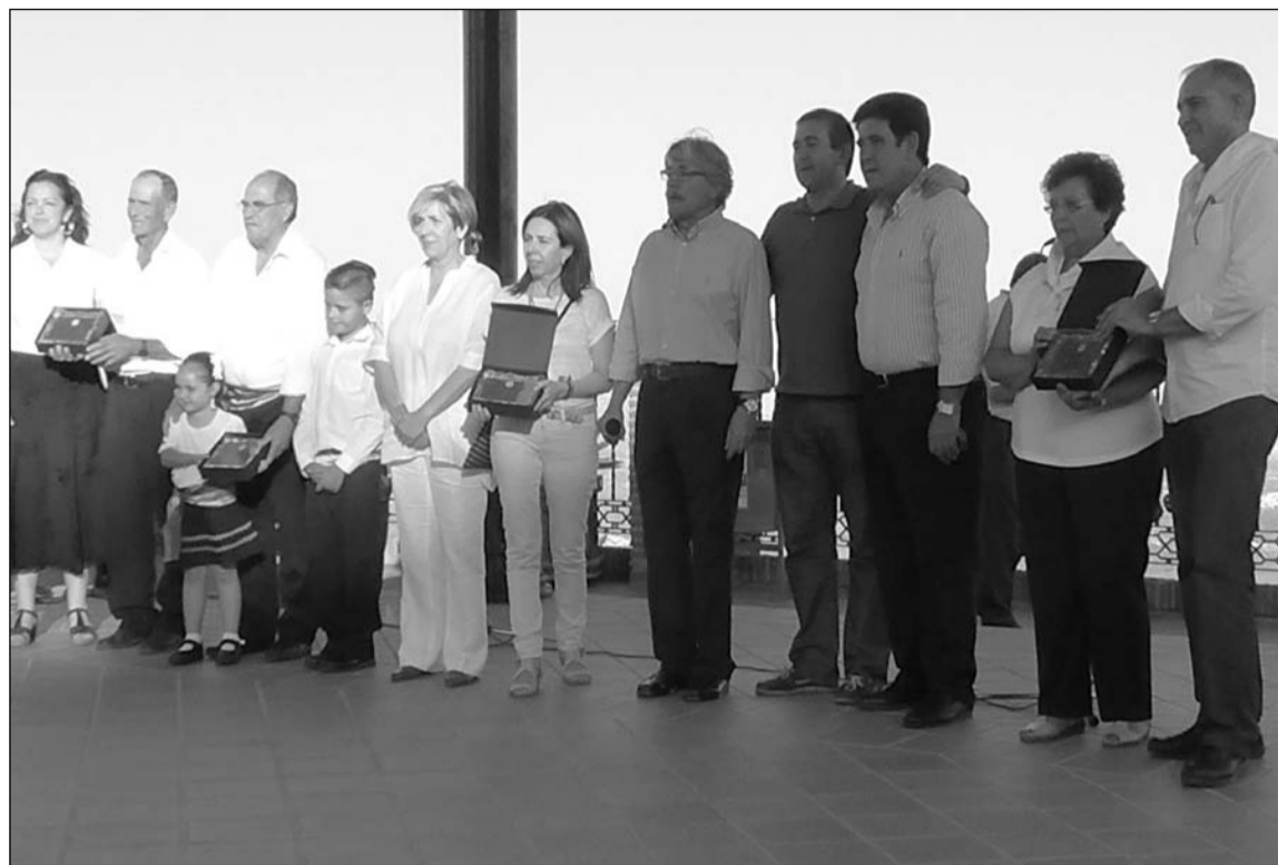
Autoridades, organizadores y representantes de las entidades participantes.