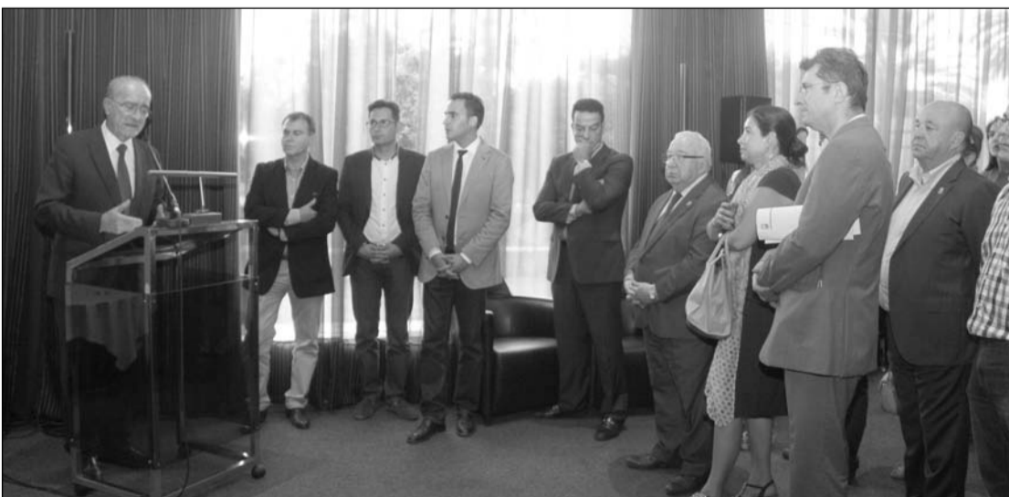
El alcalde de Málaga, Francisco de la Torre, inaugura en la tarde del miércoles 1 de julio en el hotel AC Málaga Palacio la exposición 'Málaga de cara al mar', compuesta por imágenes de las intervenciones arqueológicas llevadas a cabo hasta el momento dentro del proyecto de renovación urbana del entorno de la Catedral, la Cortina del Muelle. Entre los asistentes a este acto se encontraba el presidente de la Federación Malagueña de Peñas, Miguel Carmona.