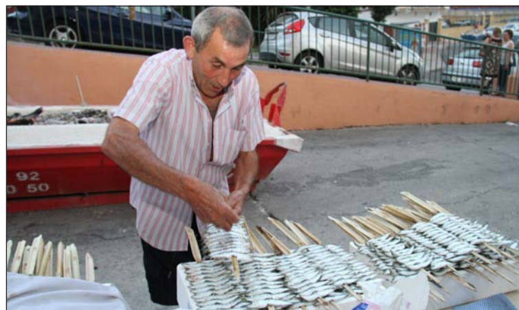
Preparativos de los espetos.