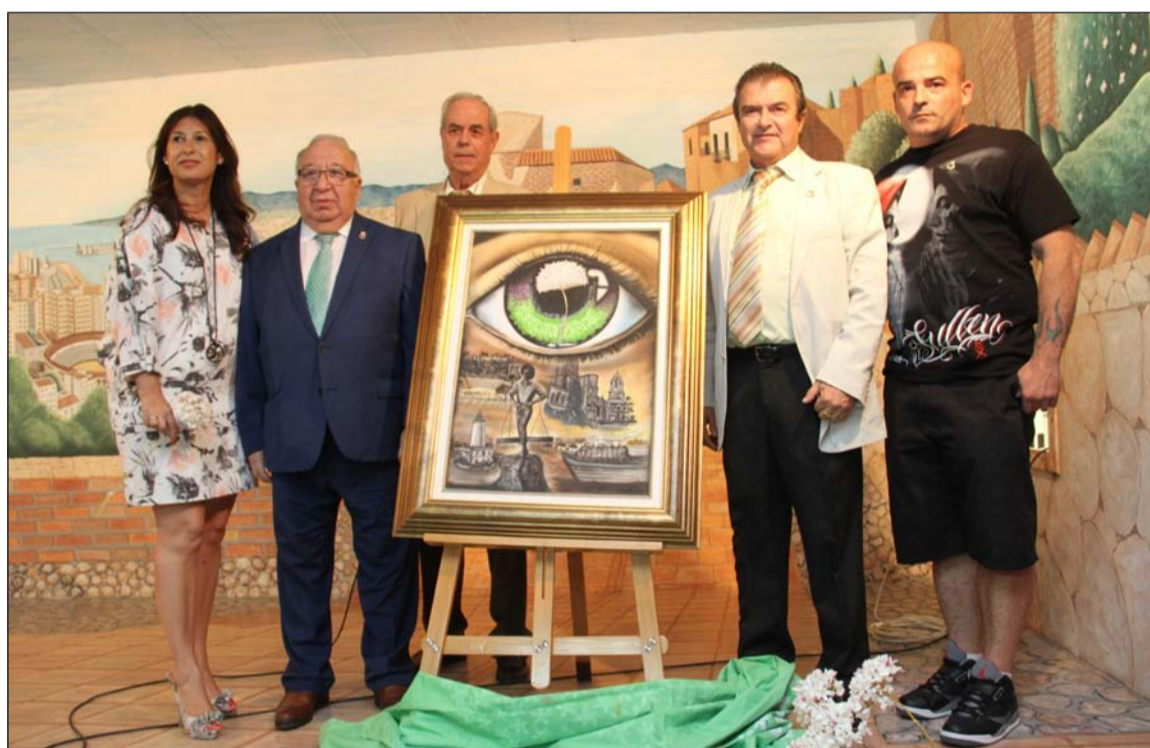
Acto de presentación de la XXXIX Fiesta de la Biznaga.