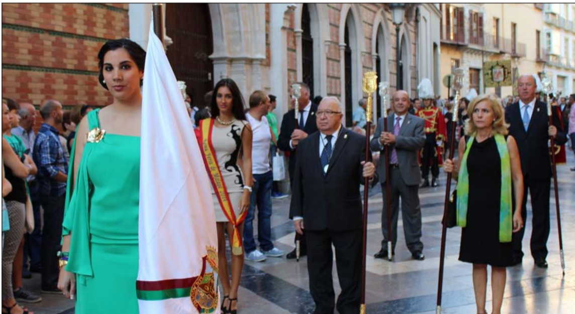
Representación de la Federación de Peñas en la procesión de los Santos Patronos.