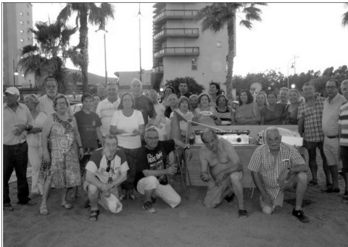
Celebración de San Juan.