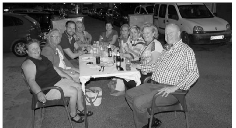
Peñistas con algunos de los invitados.