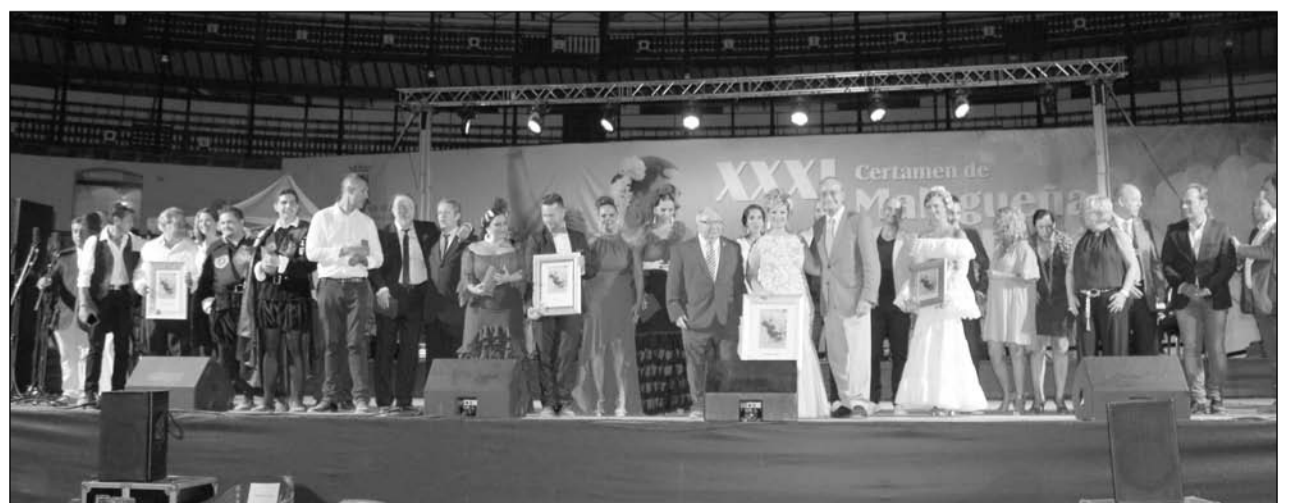
Vista general de todos los participantes con las autoridades presentes.