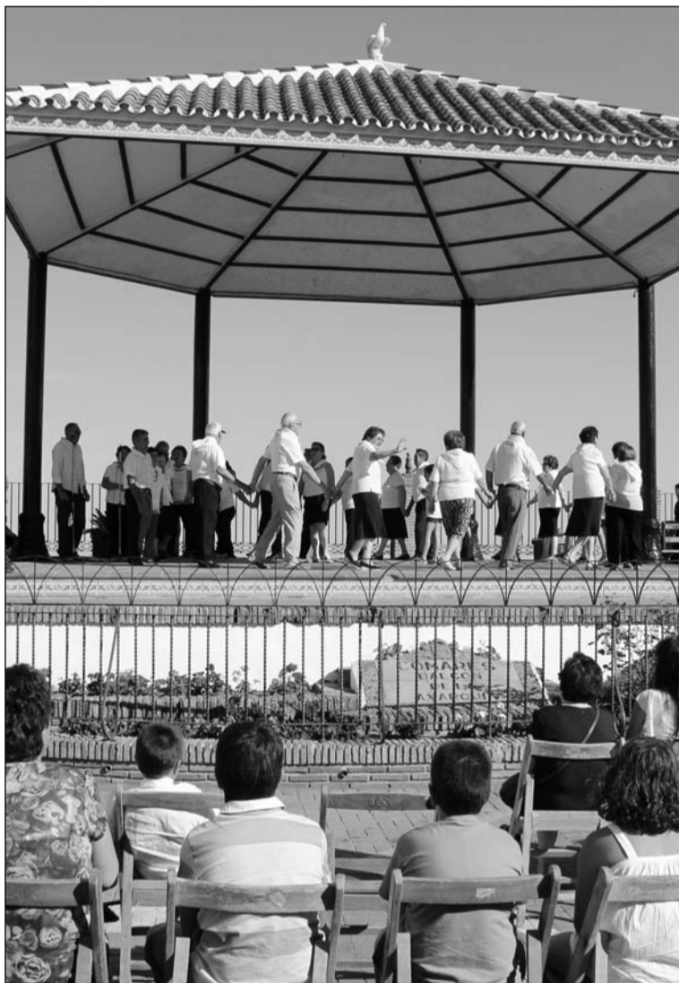
Desarrollo del encuentro.