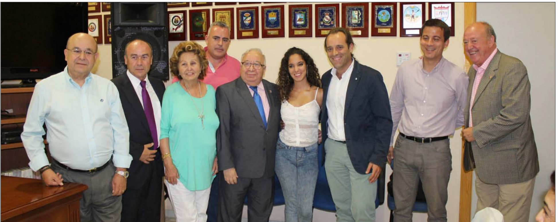
Visita a la Escuela de Copla 'Miguel de los Reyes'.