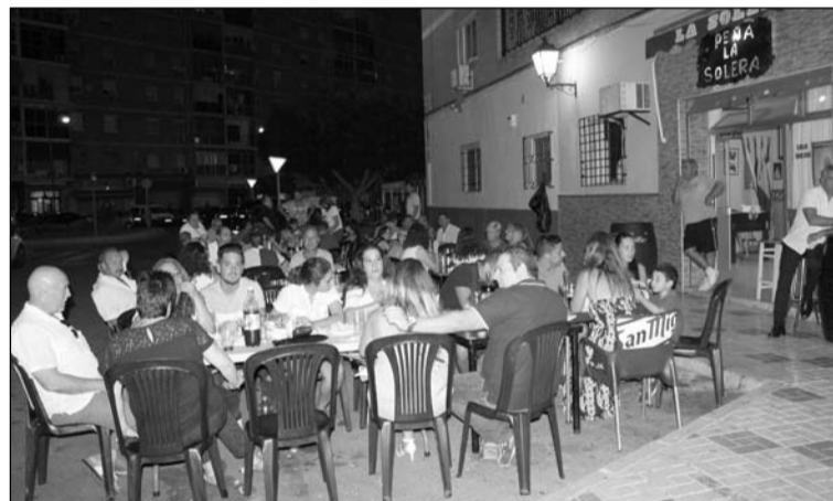
Aspecto que presentaba el exterior de la sede.