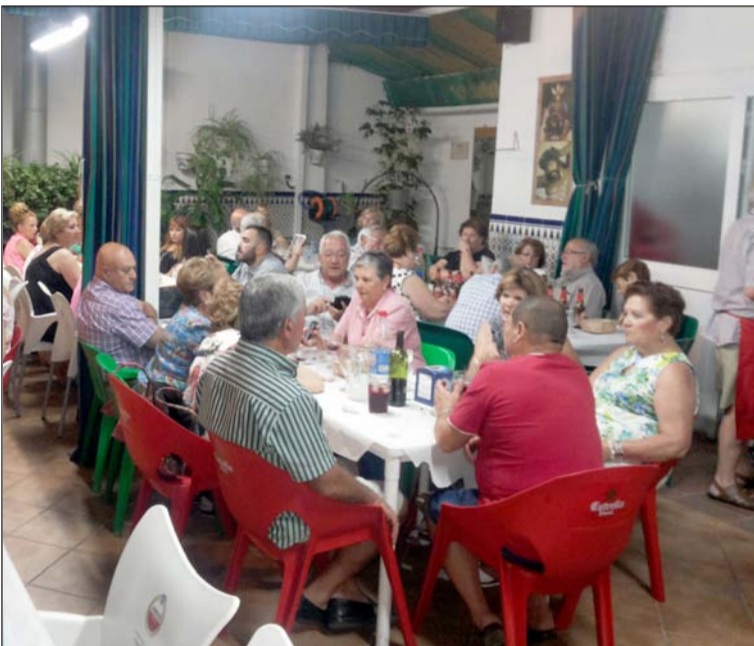
Aspecto que presentaba la terraza de la entidad.