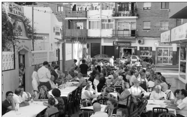
Aspecto que presentaba el exterior de la sede.