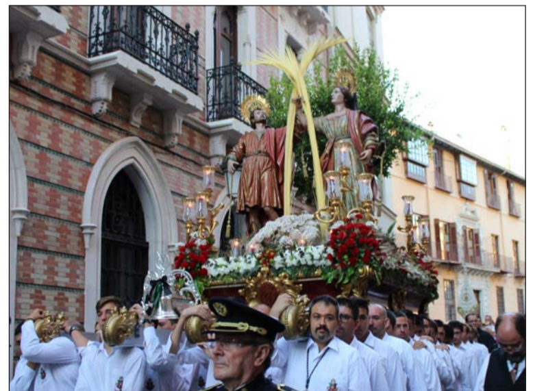
El trono, tras su salida de la catedral.