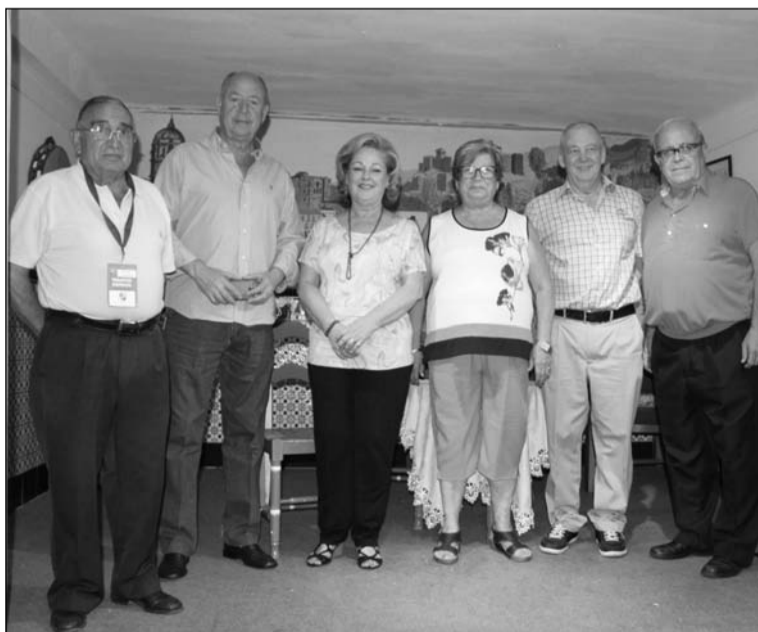
Socios y representantes de la Federación.