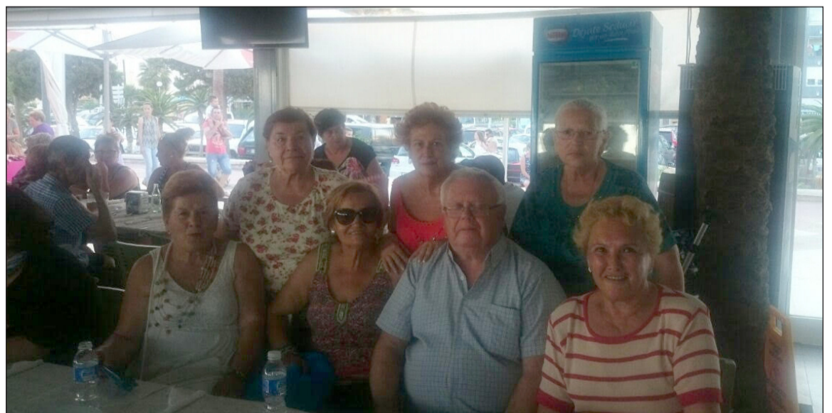
Componentes de la entidad.

De este modo, fueron un total de 150 los socios que se desplazaron para disfrutar de esta agradabilísima velada celebrada en el Chiringuito Miguel, donde pudieron degustar el pescado frito típico de todo nuestro litoral.