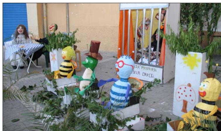
Los júas fueron quemados a la medianoche.