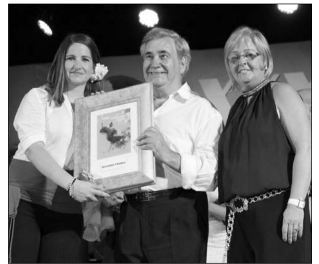
Coro Rebalaje, Segundo Premio.