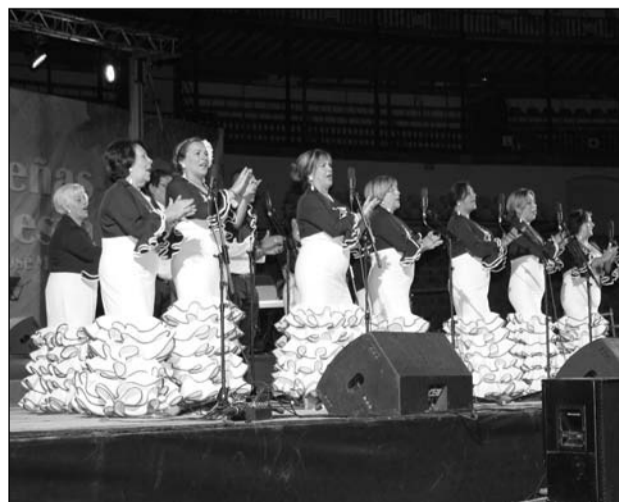
Coro Hermandad de la Alegría.