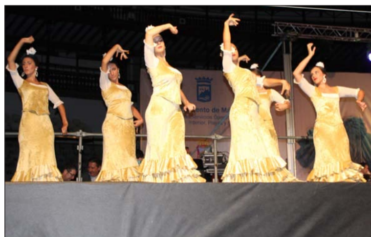
Uno de los grupos de baile participantes.

Los temas finalistas serán incluidos en un CD que será distribuido entre las casetas de la Feria de Málaga.