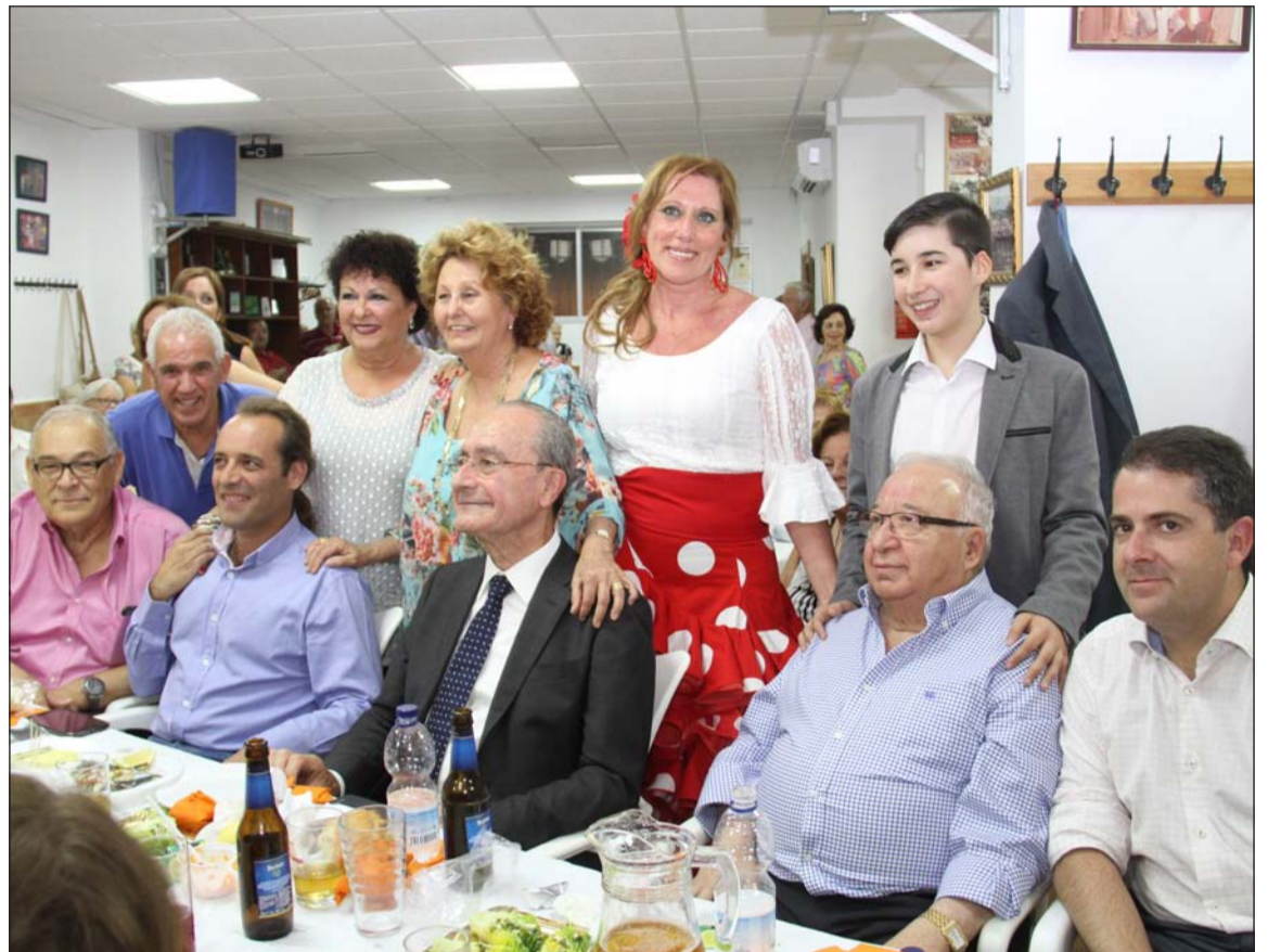
Autoridades, peñistas y artistas que participaron.