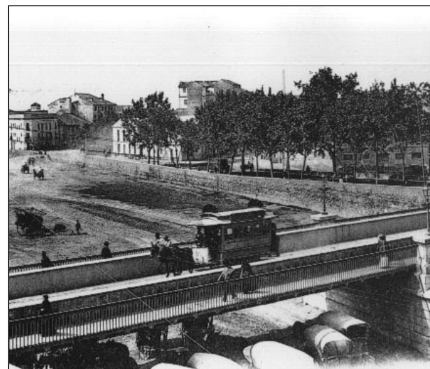
Tranvía de sangre. Puente de Tetuán, 1898.

A continuación hacemos un repaso a la historia del transporte público en nuestra capital, a través de una selección de obras gráficas que se pueden contemplar en la exposición y que reflejan su evolución desde 1898 hasta la actualidad.