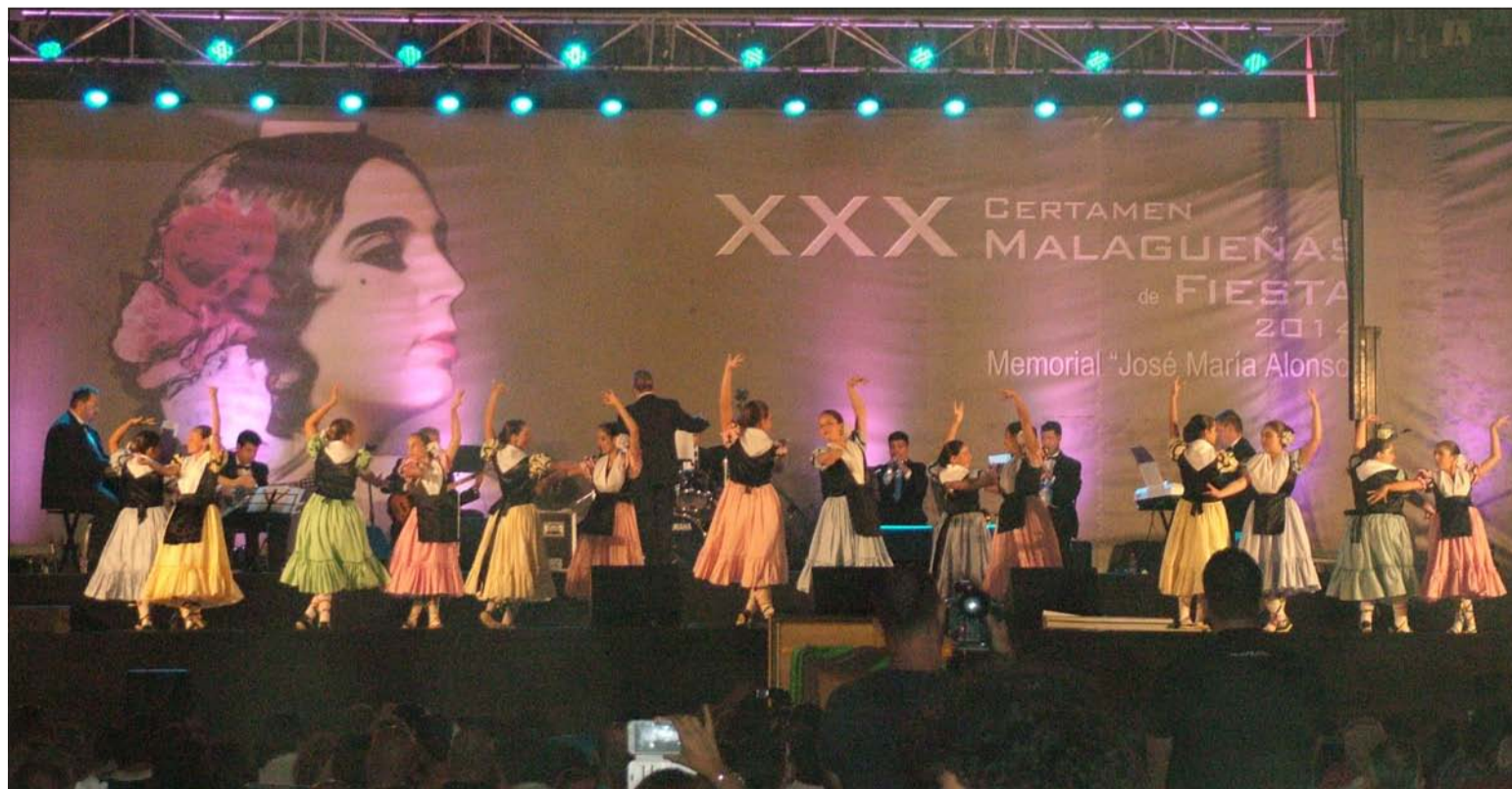
Grupos de baile sobre el escenario.

cripción, hasta el próximo 8 de mayo, de 9 a 14 horas, en el Área de Servicios Operativos, Régimen Interior, Playas y Fiestas, situado en Camino de San Rafael 99 de nuestra capital.