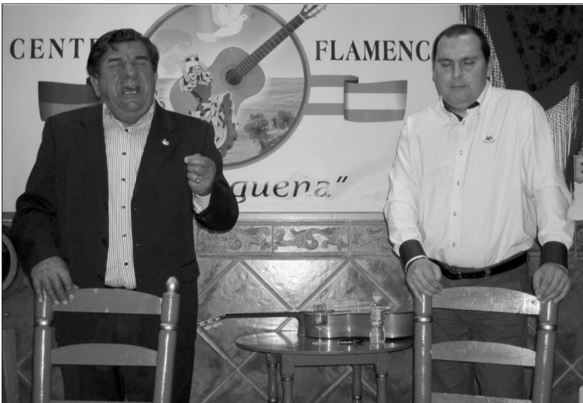
Padre e hijo, cantando por tonás.