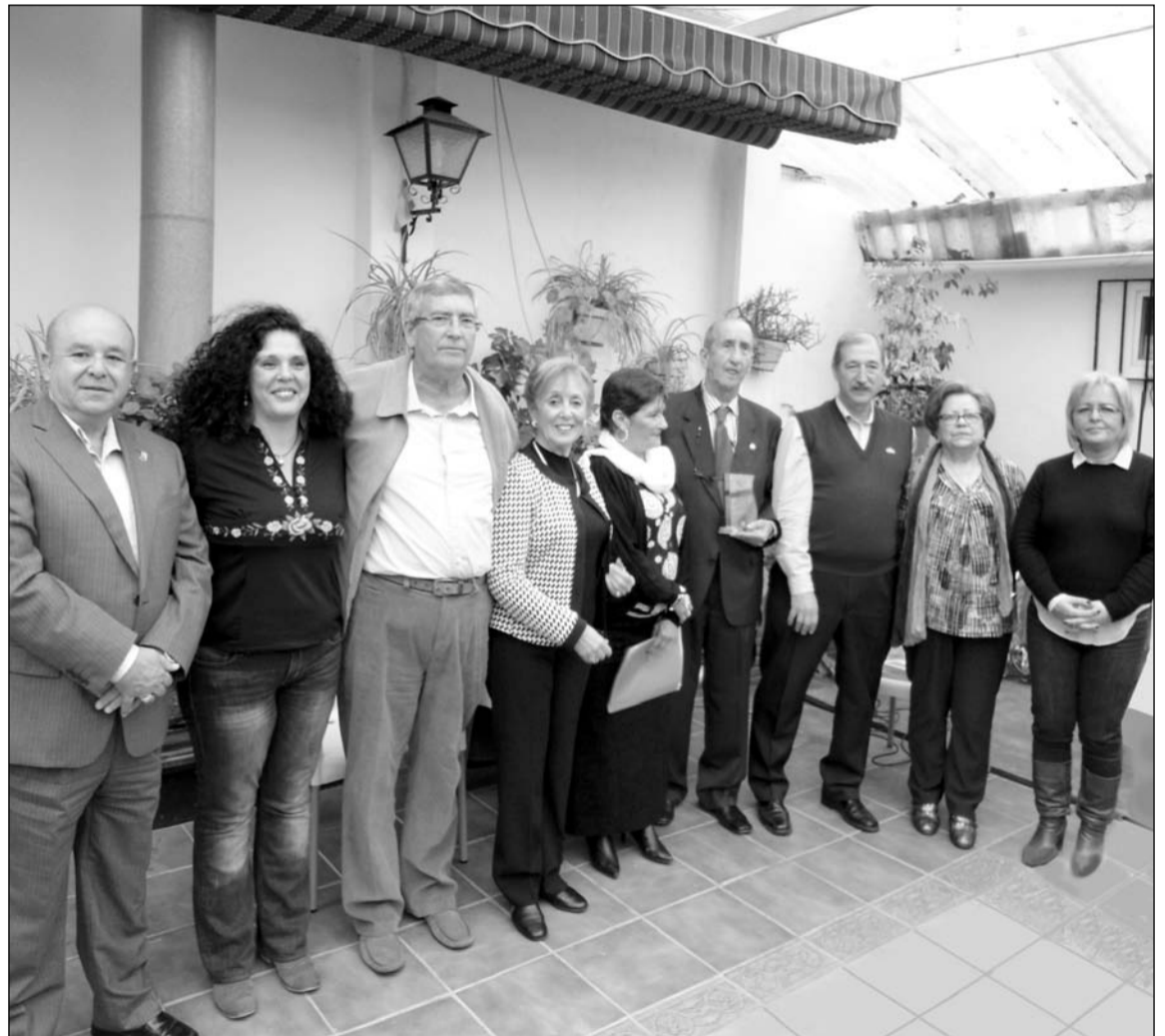
Invitados al acto, junto a representantes de la entidad.

Finalmente, para el domingo 26 de abril se propone una ruta de senderismo a Alhama de Granada, en la que cada uno se llevará su comida para comer en el campo.