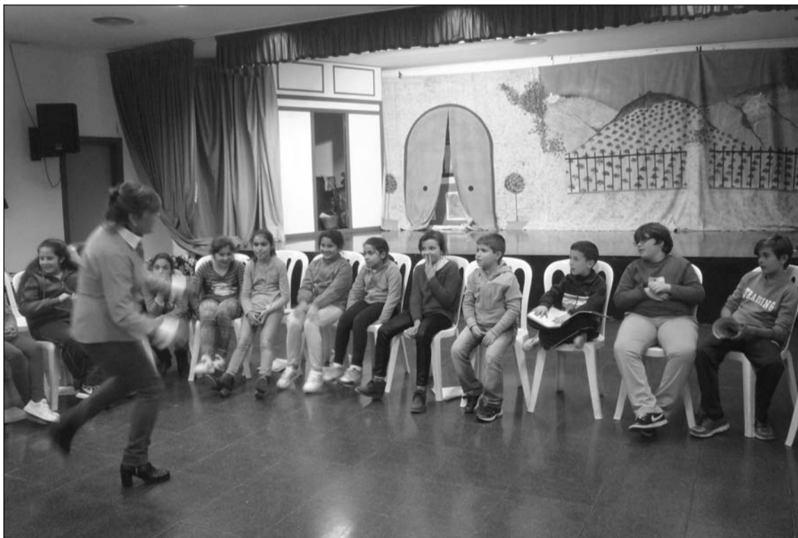
Niños y niñas del Taller de Maragatas de Colmenar recibiendo las clases de su profesora.