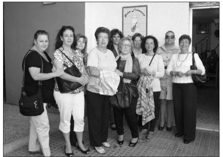
Un grupo de socias en el exterior de la peña.