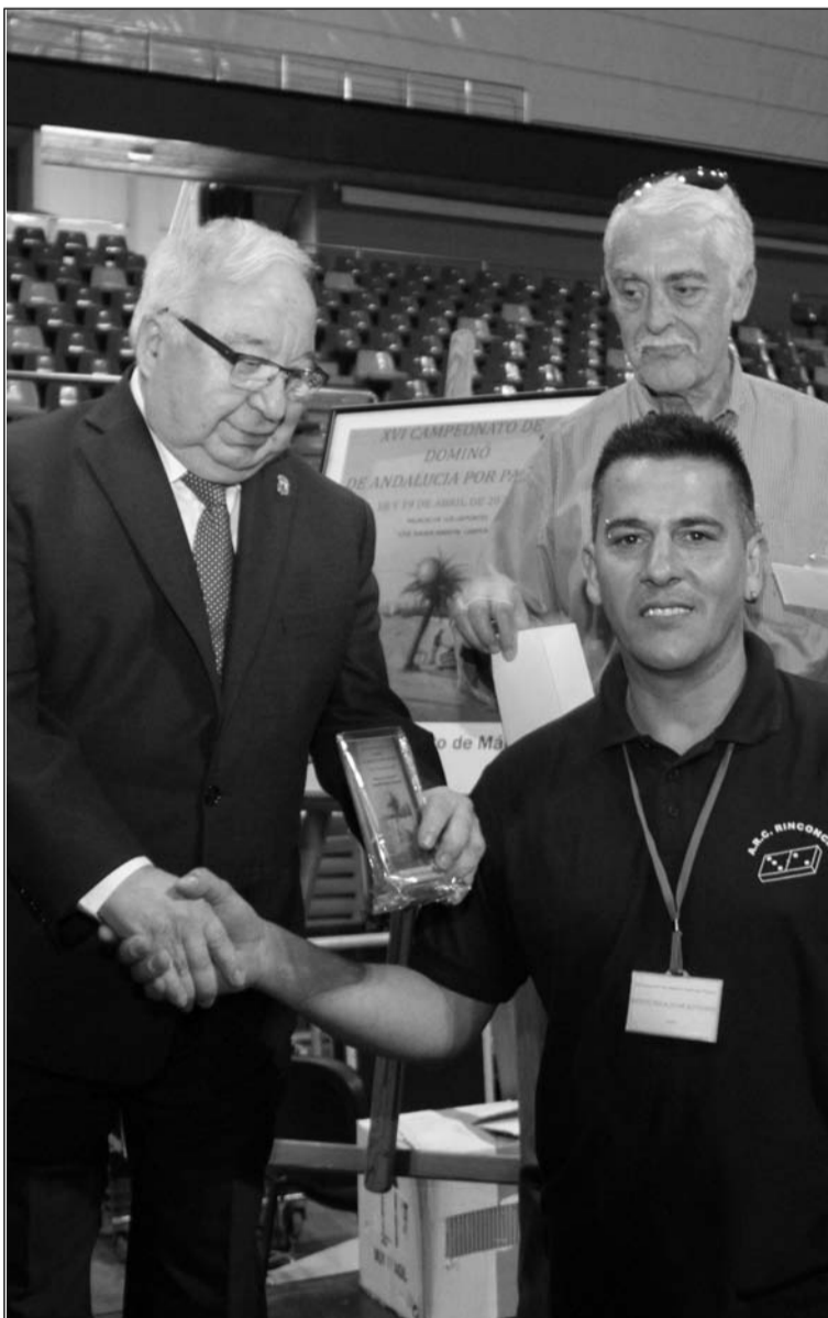
Acto de entrega de premios.