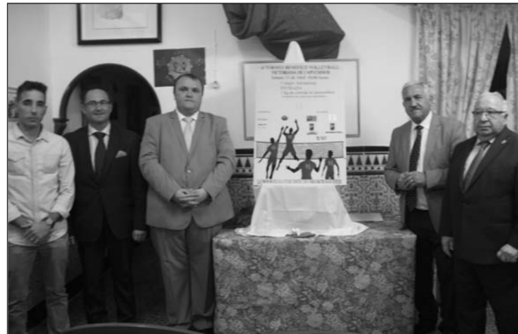
Presentación del cartel.

La Asociación de Vecinos Victoriana de Capuchinos y de la Fuente presentaba el pasado viernes el cartel de su II Torneo Benéfico de