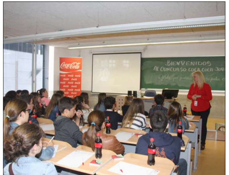
Alumnos en un aula de la Facultad de Comercio y Gestión.