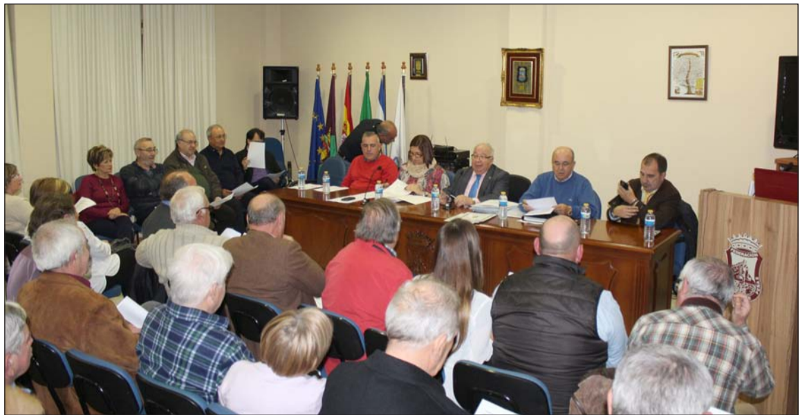
Imagen de la Asamblea General Ordinaria del pasado mes de enero.

El orden del día de la asamblea extraordinaria, por su parte, también incluye la lectura del acta anterior, el sorteo de candidatos para la presentación de su mandato, la elección de nuevo presidente y la modificación del artículo 37 de los Estatutos, para adecuarlos al artículo 11.4 de la Ley Orgánica 1/2002, de 22 de marzo de 2002 reguladora del Derecho de Asociación de la Junta de Andalucía.