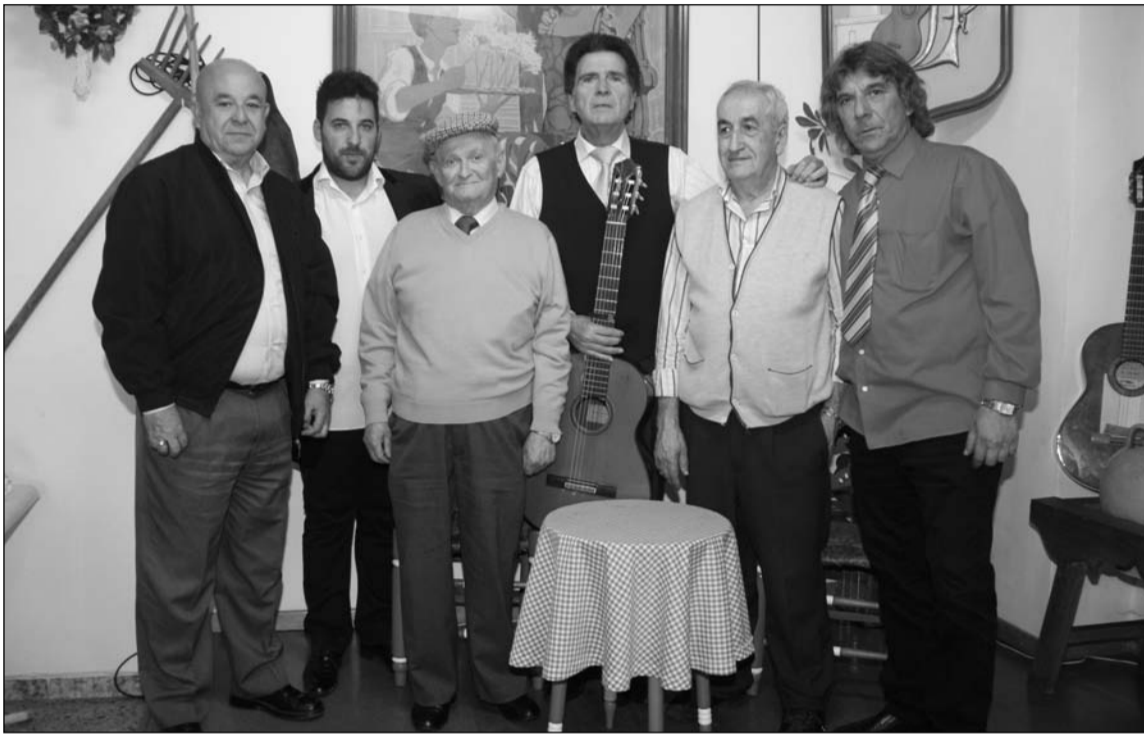
Artistas y peñistas, antes de comenzar el espectáculo.