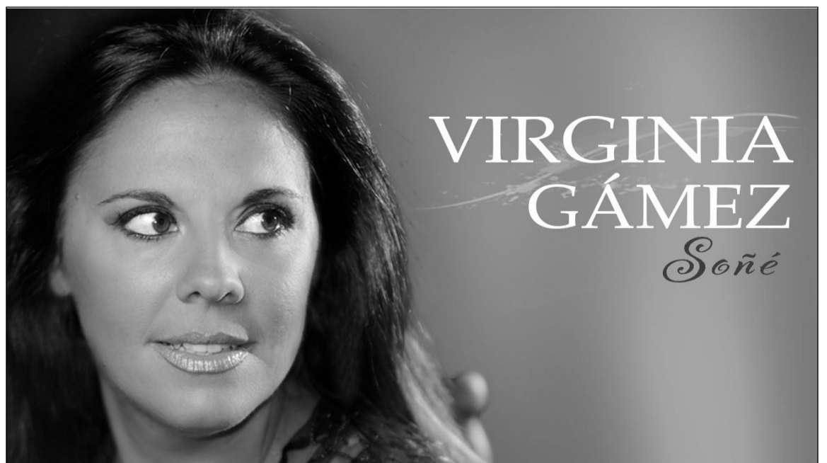
Detalle del cartel anunciador del nuevo disco de la artista malagueña.