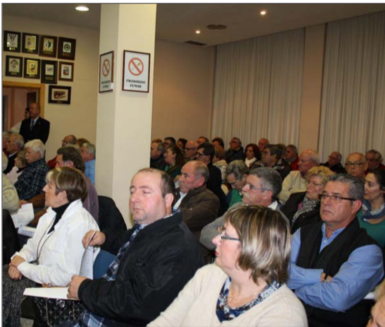
Directivos y representantes de entidades federadas.