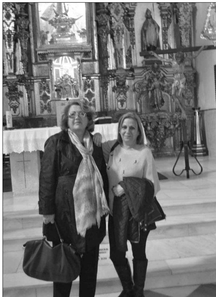
Visita a una de las iglesias de Chiclana.