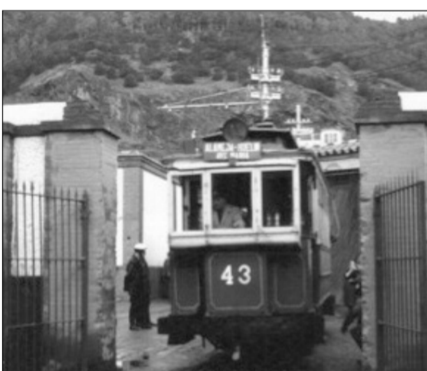
Tranvía saliendo de las Cocheras de La Malagueta. Década de los 50.