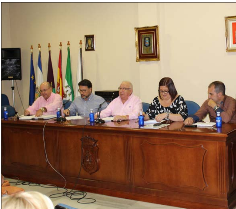
Componentes de la directiva saliente.