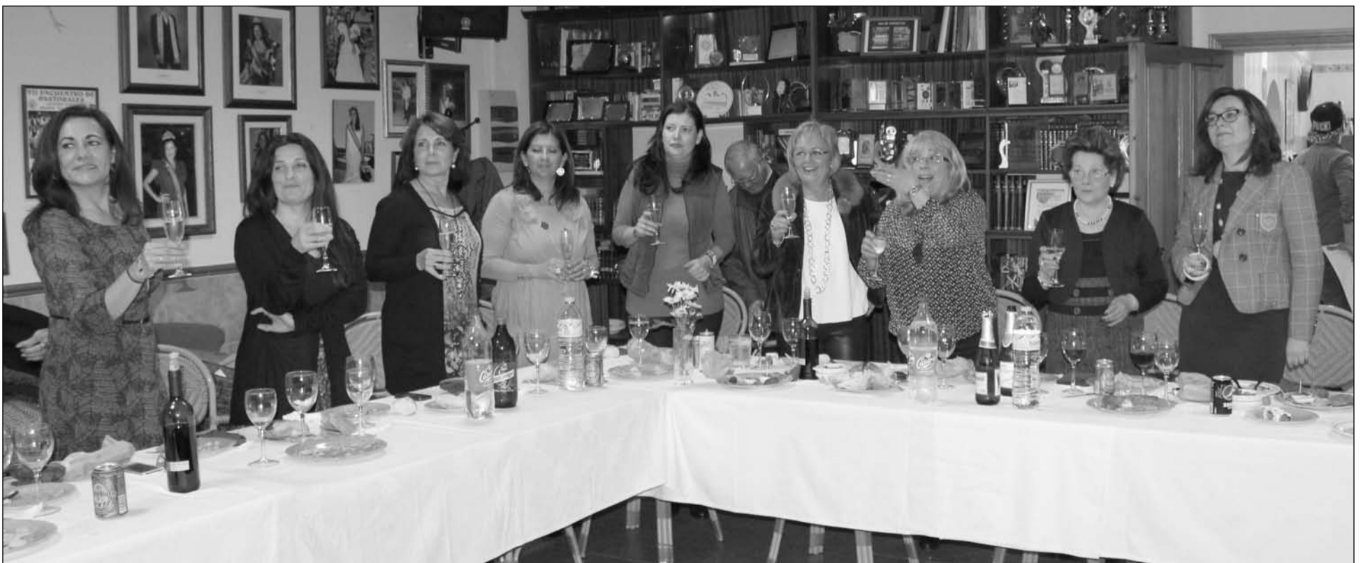
Brindis en la mesa con algunas de las autoridades asistentes y las organizadoras.

Debido al éxito de estas comidas para mujeres, son numerosas las entidades que se han ofrecido para acoger nuevas ediciones en sus sedes.