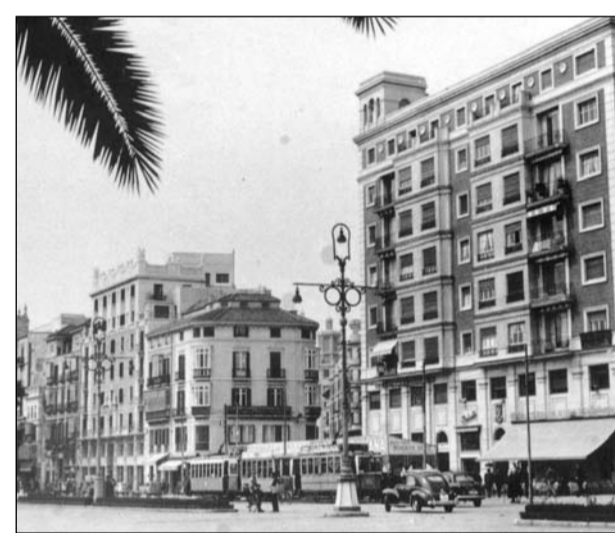
Única parada de tranvías con marquesina. Plaza de la Marina, años 50.