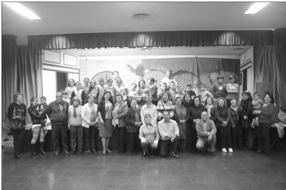
Grupo de personas que componen el Taller de Maragatas o Molineras en Colmenar.

En apariencia sus cantes y bailes son parecidos, pero existen claras diferencias entre ellas, evidenciándose en los tonos de las coplas, las letras de las mismas o en el propio baile, contribuyendo con ello a su propia riqueza.