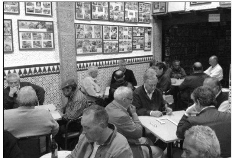
Torneo de Dominó en la sede de la Peña El Palustre.