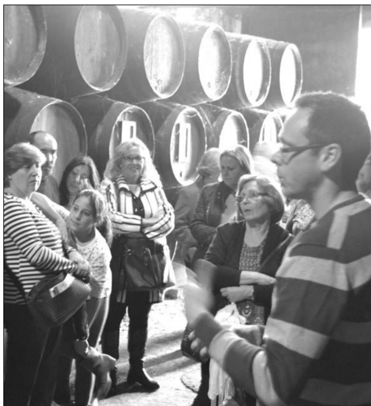
Los peñistas pudieron conocer una de las bodegas de la zona.

Alcazaba, desde la Peña Cultural Malaguista de Ciudad Jardín se quiere mostrar su reconocimiento "al Ayuntamiento de Chiclana de la Frontera y muy especialmente a las señoritas de la Delegación de Turismo, que nos atendieron muy diligentemente en todo momento".