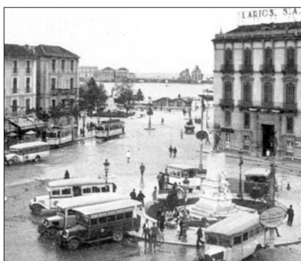
Tranvías y autobuses en Acera de la Marina, 1930.