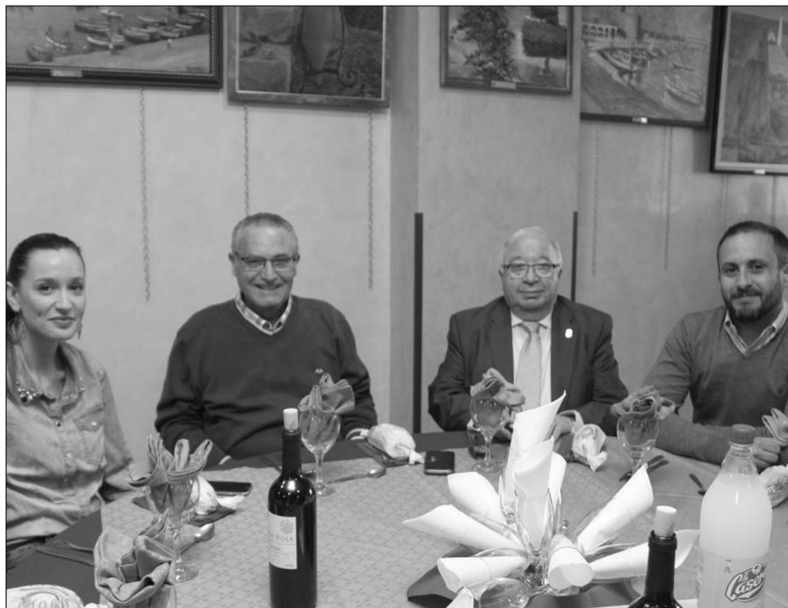
Un instante del Potaje celebrado antes de la presentación del libro