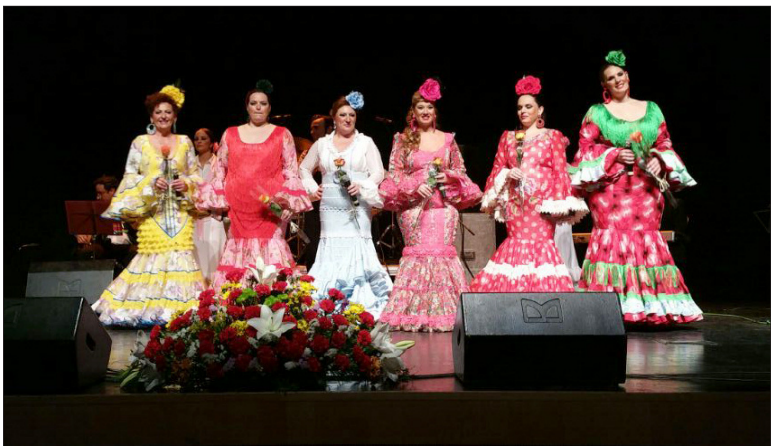
Componentes del elenco de 'Suspiros de España' saludan al público.

Los fondos recaudados fueron a parar a la Asociación de Mujeres y Hombres en Acción Positiva.