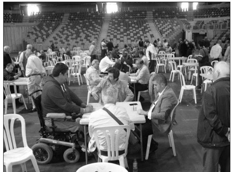
Aspecto que presentaba la pista del Martín Carpena durante la competición.