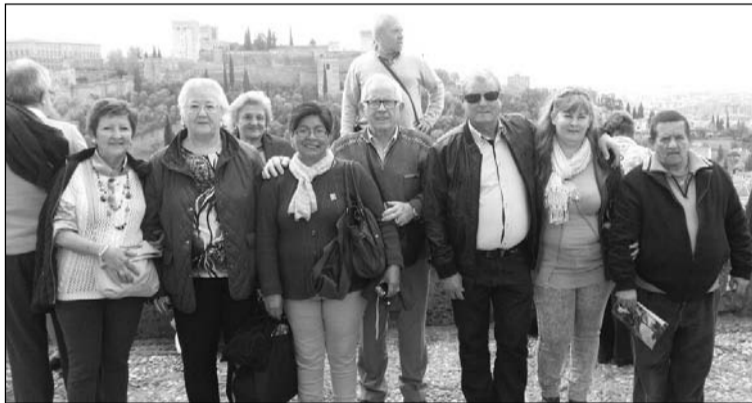
Peñistas con la Alhambra de fondo.

La Peña Los Rosales, una entidad perteneciente a la Federación Malagueña de Peñas, Centros Culturales y Casas Regionales 'La Alcazaba' organizó en la jornada del pasado 8 de abril una excursión a la localidad de Granada, donde sus socios pudieron disfrutar de los múltiples encantos con los que cuneta la capital de la Alhambra.