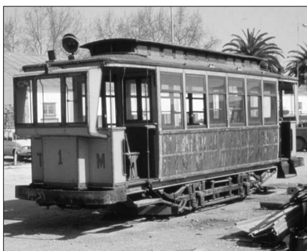
Tranvía 63, antes de su primera restauración, en 1981.