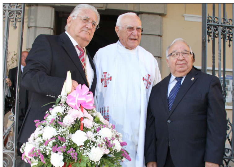
El hermano mayor, el sacerdote y el presidente de la Federación de Peñas.

colectivo peñista también participa en un cortejo que pasa por las puertas de la Federación Malagueña de Peñas, Centros Culturales y Casas Regionales 'La Alcazaba' que, como acaba de suceder en Semana Santa, será especialmente engalanada para recibir el paso de la Patrona.