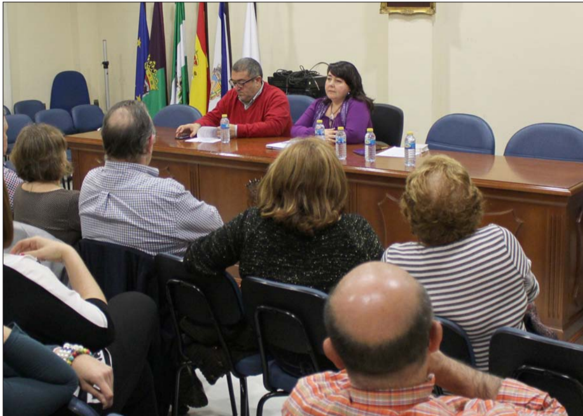
Reunión celebrada en la sede de la Federación.