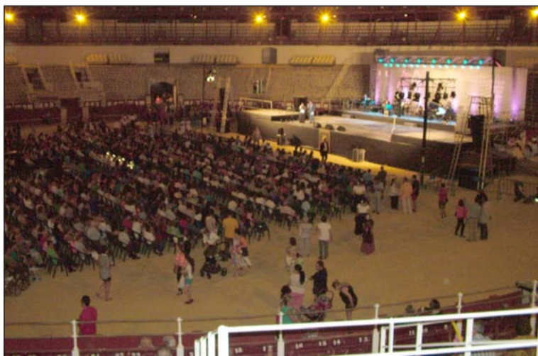
Aspecto que presentaba el pasado año La Malagueta en su gran final.