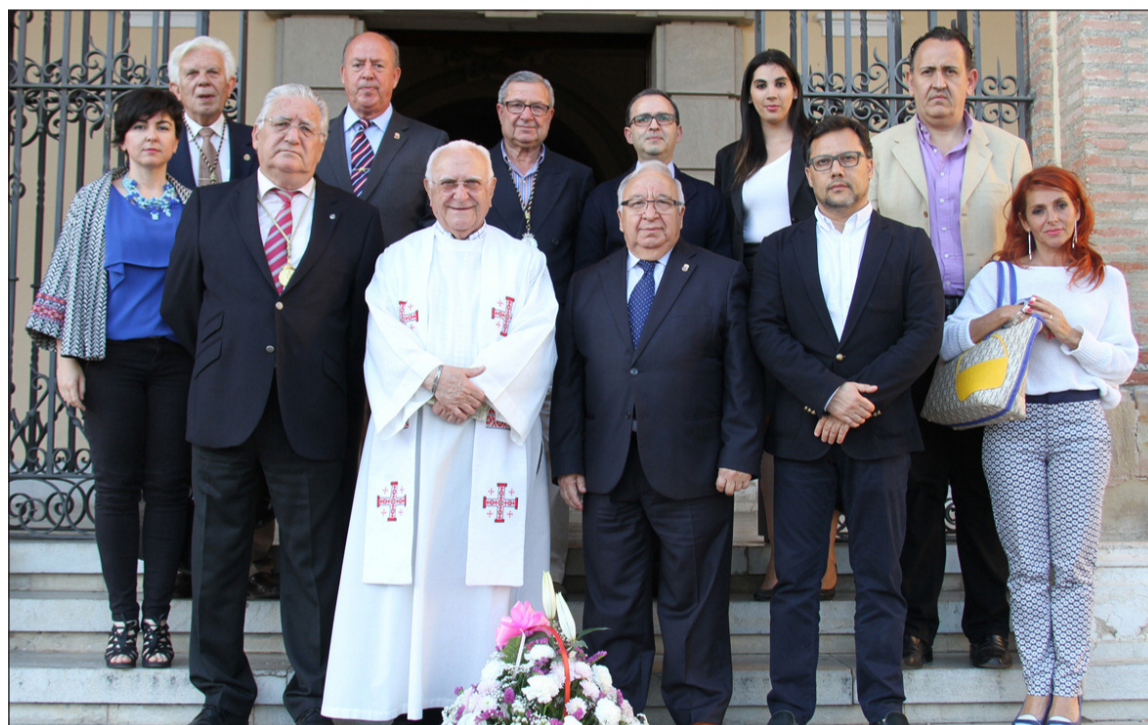
Peñistas y cofrades, junto al sacerdote, el pasado mayo de 2014 en las puertas del templo.

Entidades colaboradoras con esta publicación: