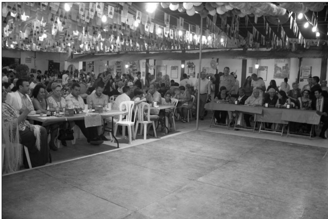
Interior de una caseta de una peña.