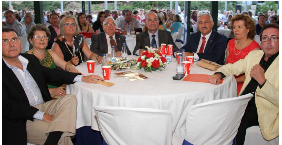
Mesa presidencial en la entrega de trofeos del certamen del pasado año.

La entidad que no esté representada en la entrega de premios no tendrá derecho al premio, trofeo y recuerdo de participación.