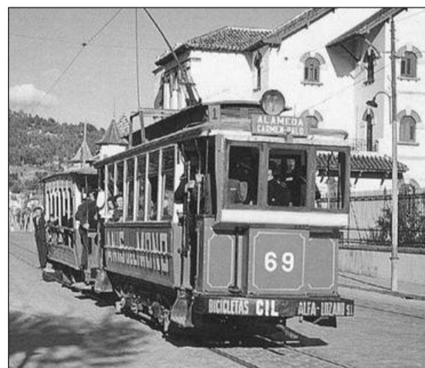
Paseo de Sancha. Foto de Jeremy Wiseman, 1958.