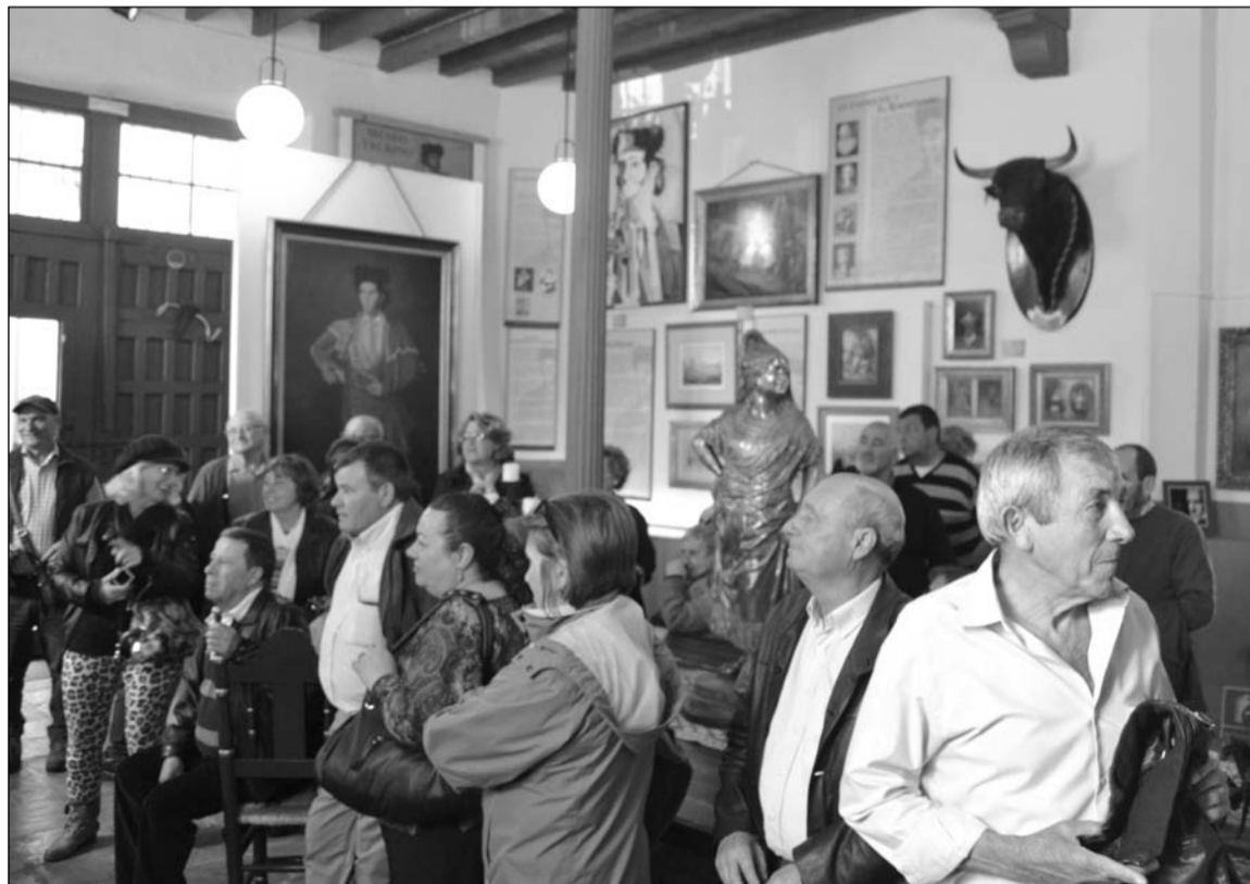
Visita al Museo de Paquiro.