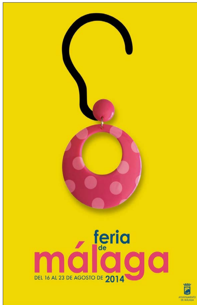
Cartel de la Feria 2014.

Las obras no premiadas deben ser retiradas por los autores, persona autorizada o agencia de transporte, por orden y cuenta del artista, en el mismo lugar de entrega a partir del día 1 de octubre y hasta el 1 de noviembre de 2015. Transcurrida esa fecha, no se devolverá ninguna obra. La no retirada de la misma conllevará la autorización para la destrucción de dicha obra, procediendo el Ayuntamiento en consecuencia; velando así por la mayor confidencialidad para con los autores.