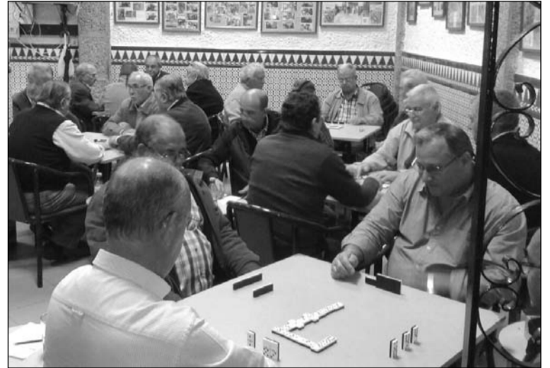
Aspecto que presentaba el salón durante la competición.

neo de Dominó Memorial Pedro Mora, una actividad que contó con una importante participación de socios y jugadores de la barriada el El Palo.