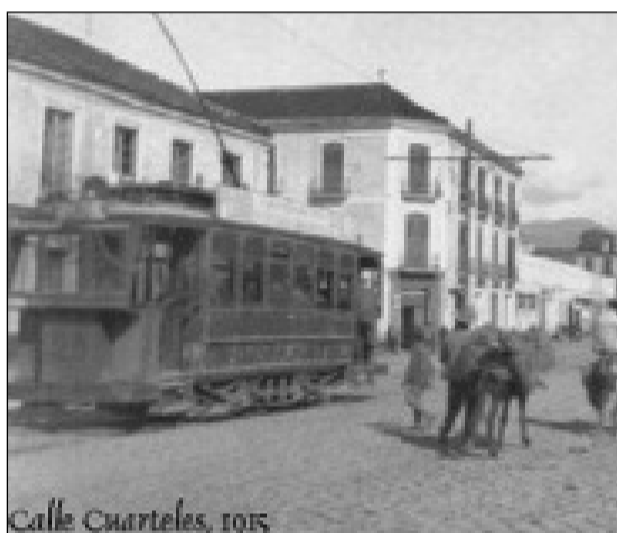
Tranvía. Calle Cuarteles, 1915.