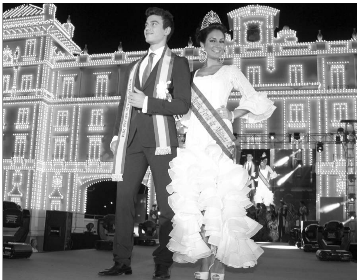
La Reina y el Mister de la Feria 2014, con la portada de fondo.

de la dirección técnica de las instalaciones suscrito por un técnico competente, el documento de autorización de cada una de las instalaciones de electricidad, gas, ventilación o climatización expedidas por la Delegación Provincial de la Consejería competente de la Junta de Andalucía, el seguro de responsabilidad civil y el plan de emergencia y autoprotección.