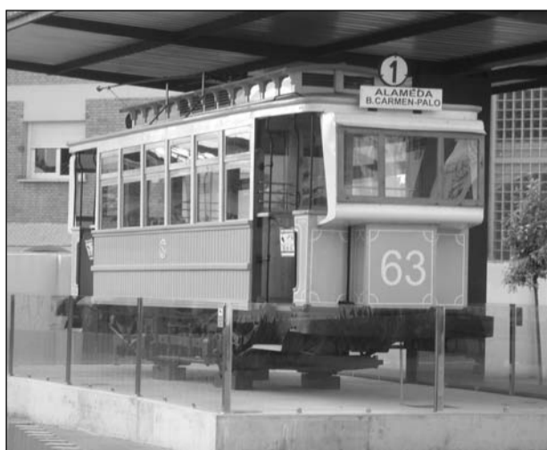
Tranvía 63, restaurado por Tran-Bus. Antiguas cocheras Pedregalejo.