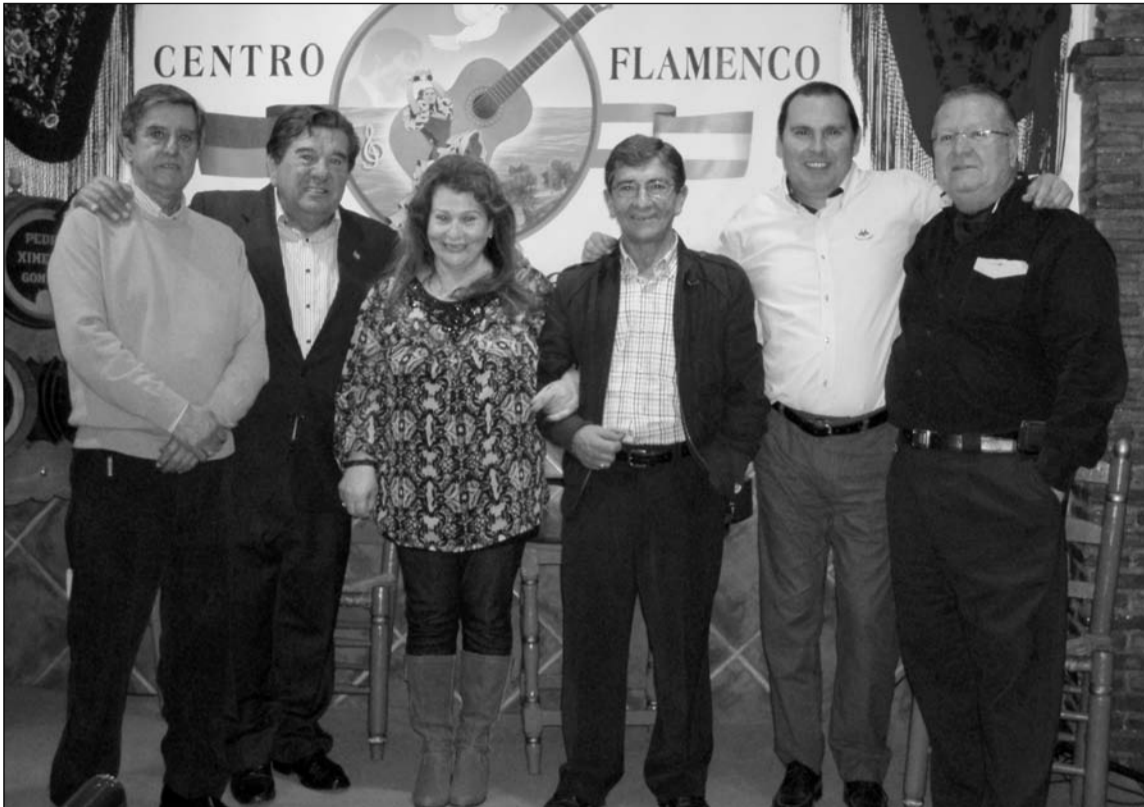
Artistas con componentes de la entidad.