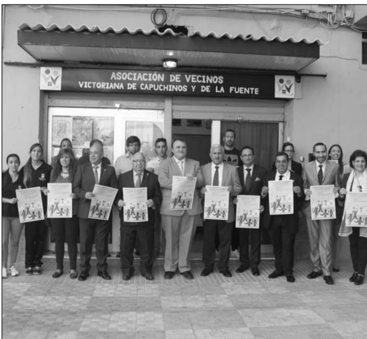
Socios e invitados con el cartel en la puerta de la sede.