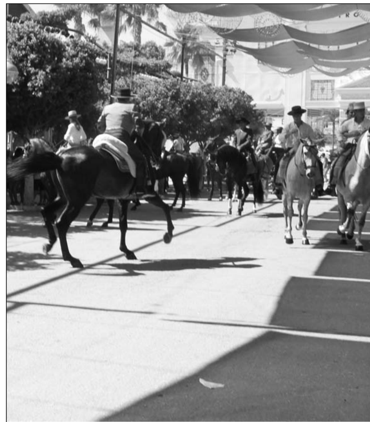
Paseo de caballos por el recinto de Cortijo de Torres.

cionantes técnicos que figuran en la documentación que acompaña la solicitud. Cuando la documentación sea suficiente, desde el punto de vista técnico y antes del 31 de julio, se expedirá la autorización de funcionamiento, comunicándola a los