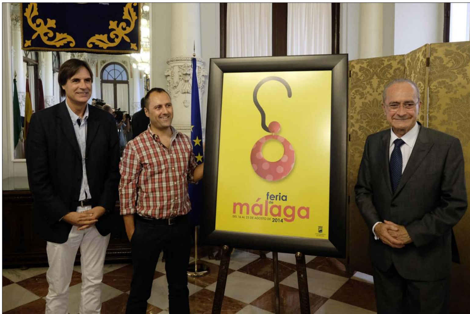
Presentación del cartel del pasado año, obra del artista cacereño Abel Rocha.