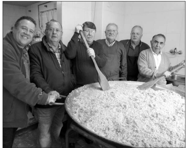
Preparativos de las Migas.