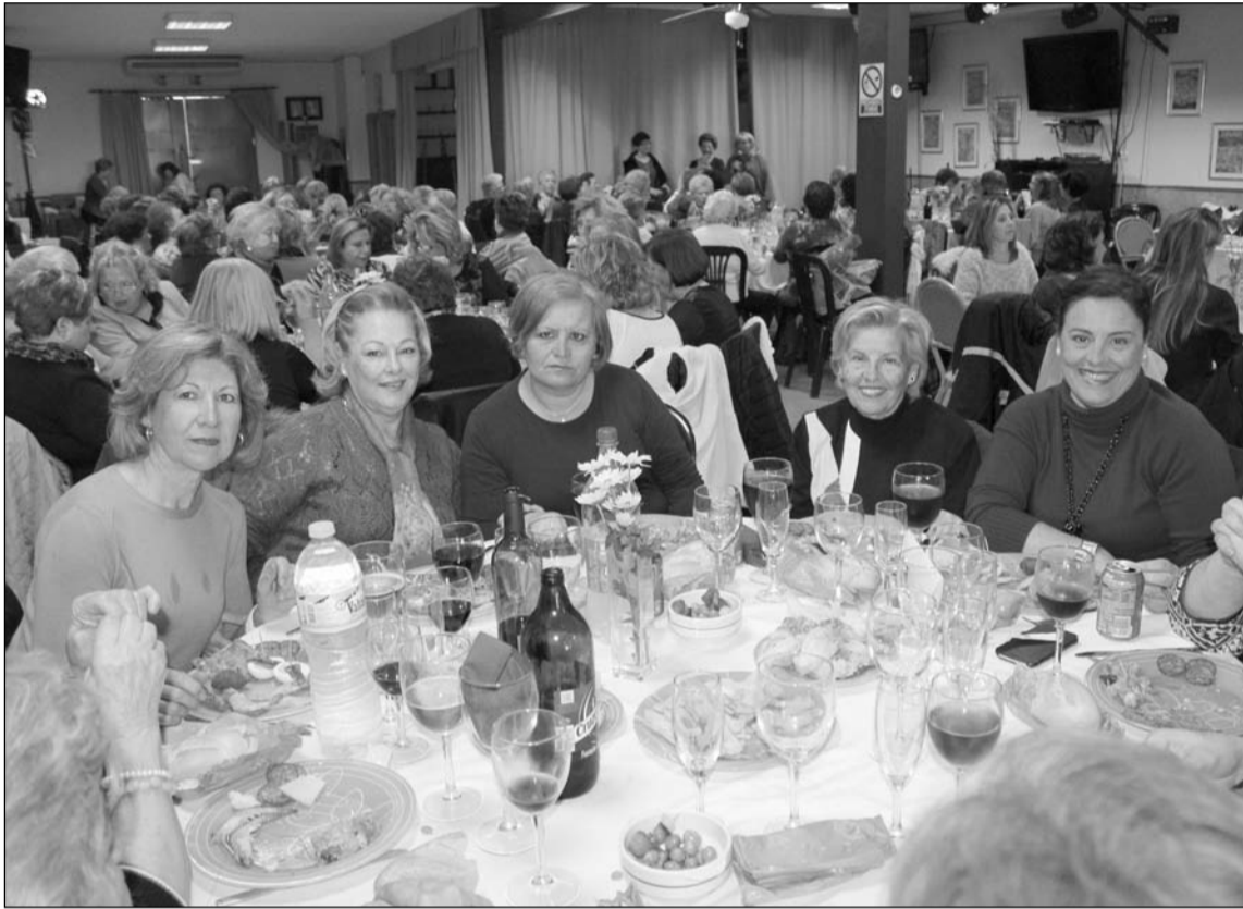
Aspecto que presentaba la sede del Centro Cultural Renfe en la comida del mes de marzo.