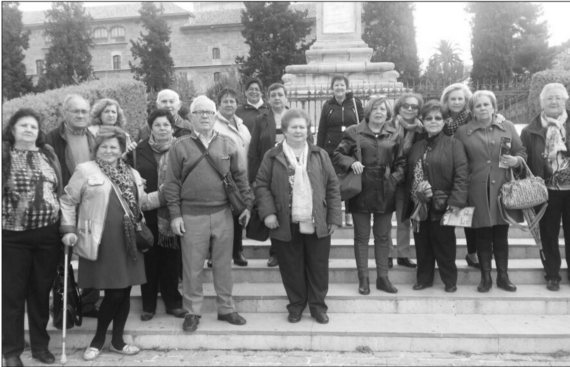
Algunos de los socios de la Peña Los Rosales en Granada.