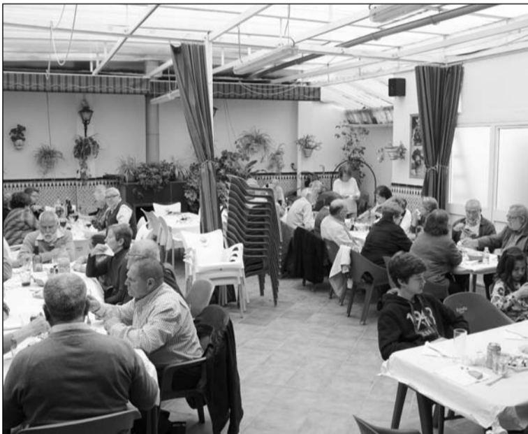
Aspecto que presentaba el patio de la entidad.