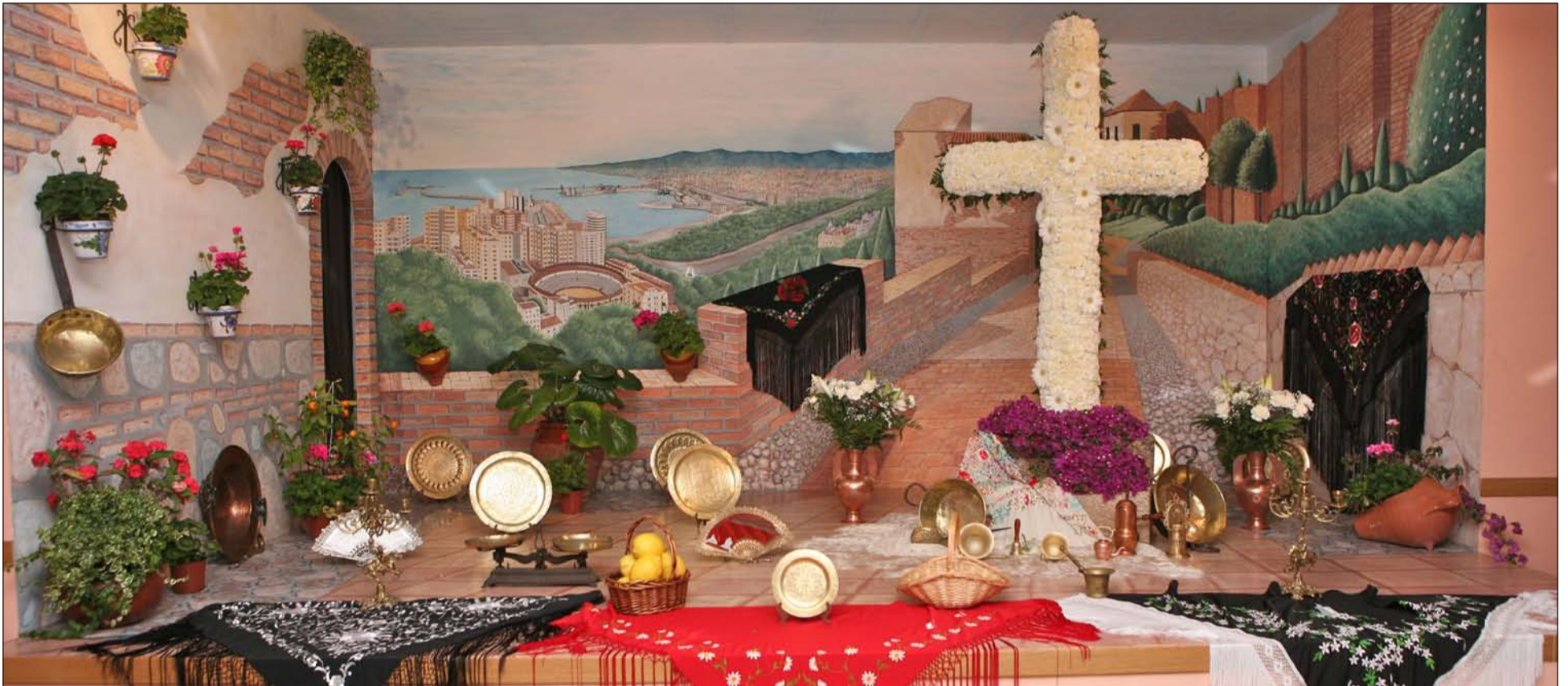
Cruz de Mayo de la Peña La Biznaga, primer premio en la edición de 2014.

Se encuentra abierto el plazo de inscripción para las visitas del jurado que se producirán a partir del día 1 de mayo