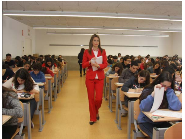
Comienzo de la prueba.

Una vez finalizada la Fase de Redacción de la prueba escrita por los alumnos, se convocará oficialmente el concurso a través de la publicación de sus bases en el BOE y en un diario de máxima difusión nacional.