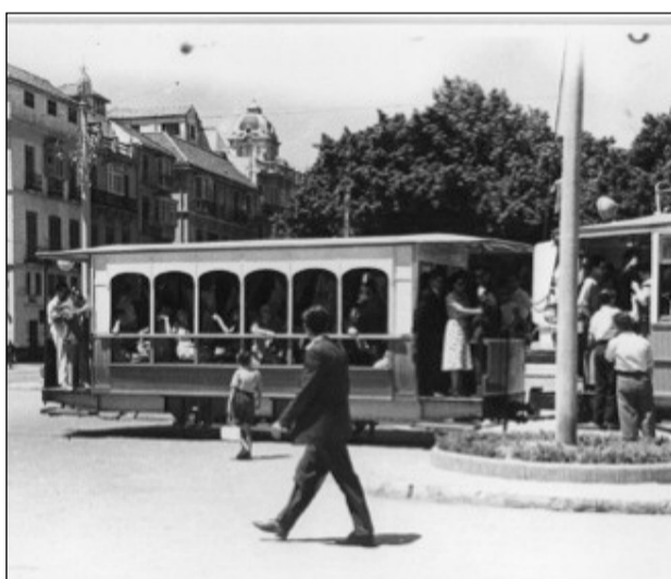
Tranvía con jardinera de verano. Década de 1950.