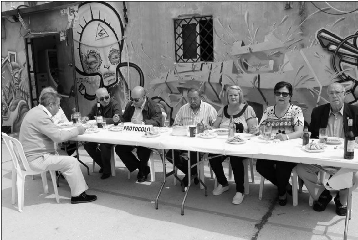
Mesa de protocolo en la comida de Viernes Santo.