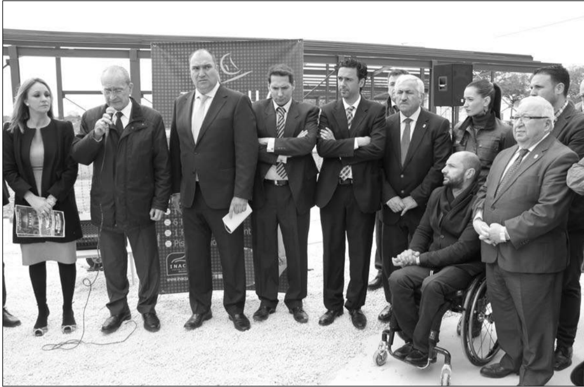
Intervención del alcalde de Málaga, Francisco de la Torre.