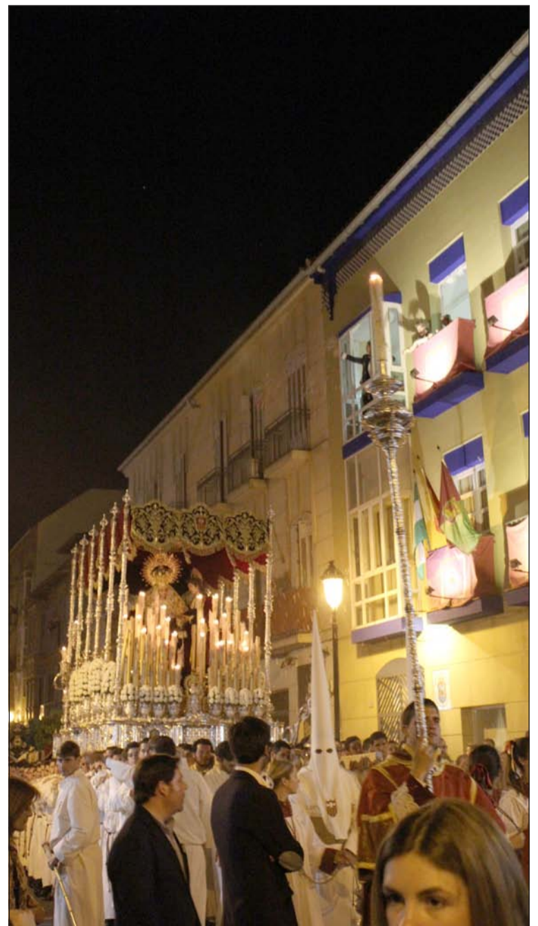
Petalada a la Virgen de la Merced en la noche del Domingo de Ramos.