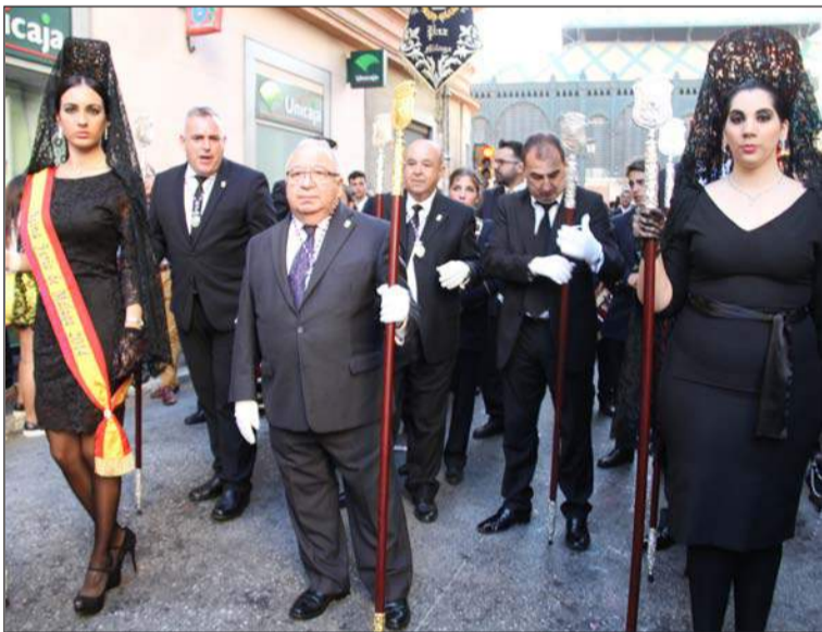
Representación peñista en la entrada al recorrido oficial.