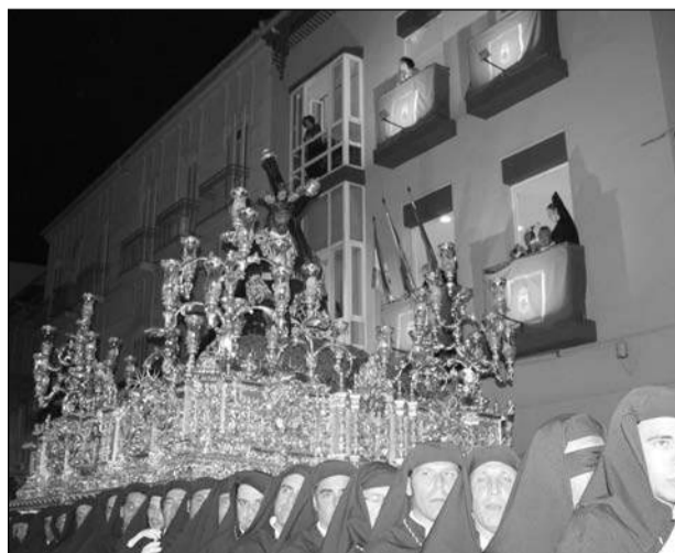
Nazareno de los Pasos a su paso por la sede de la Federación. La Novia de Málaga, en su regreso a su barrio.