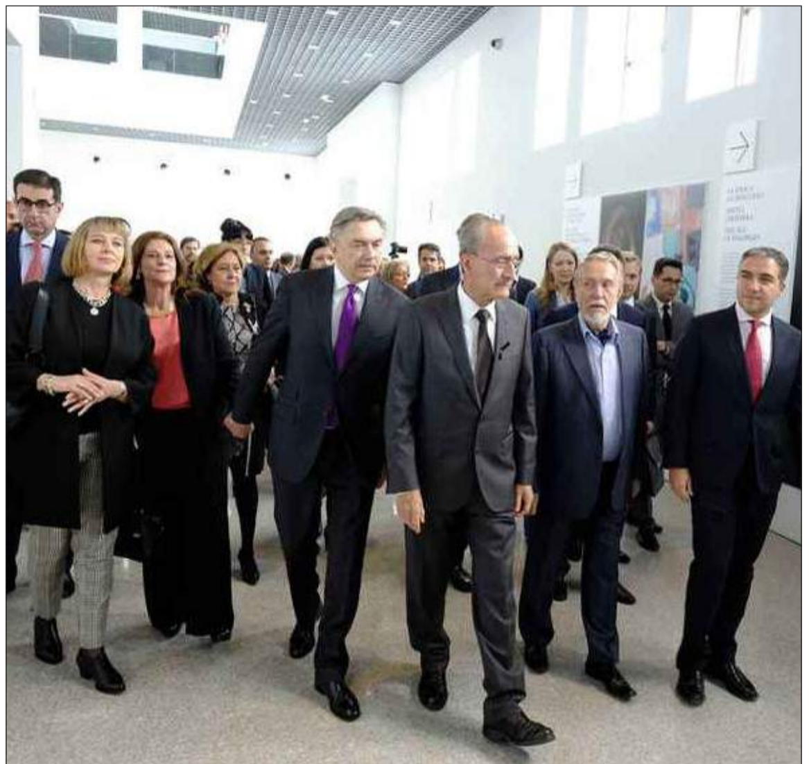
Visita a las obras que componen la colección.

La primera sede en Europa Occidental del Museo Estatal Ruso se ha establecido en Málaga como uno de los grandes hitos de su oferta cultural, otorgándole un lugar destacado en la escena artística internacional. La ciudad acogerá la nueva sede por un periodo de diez años, renovable por otros tantos. El museo albergará una serie de muestras de larga duración planteadas como un recorrido por la compleja y fascinante historia del arte ruso y su relación cambiante con la cultura europea, además de ofrecer sucesivas exposiciones temporales que com-