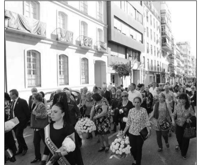
Comitiva peñista saliendo de la sede de la Federación.