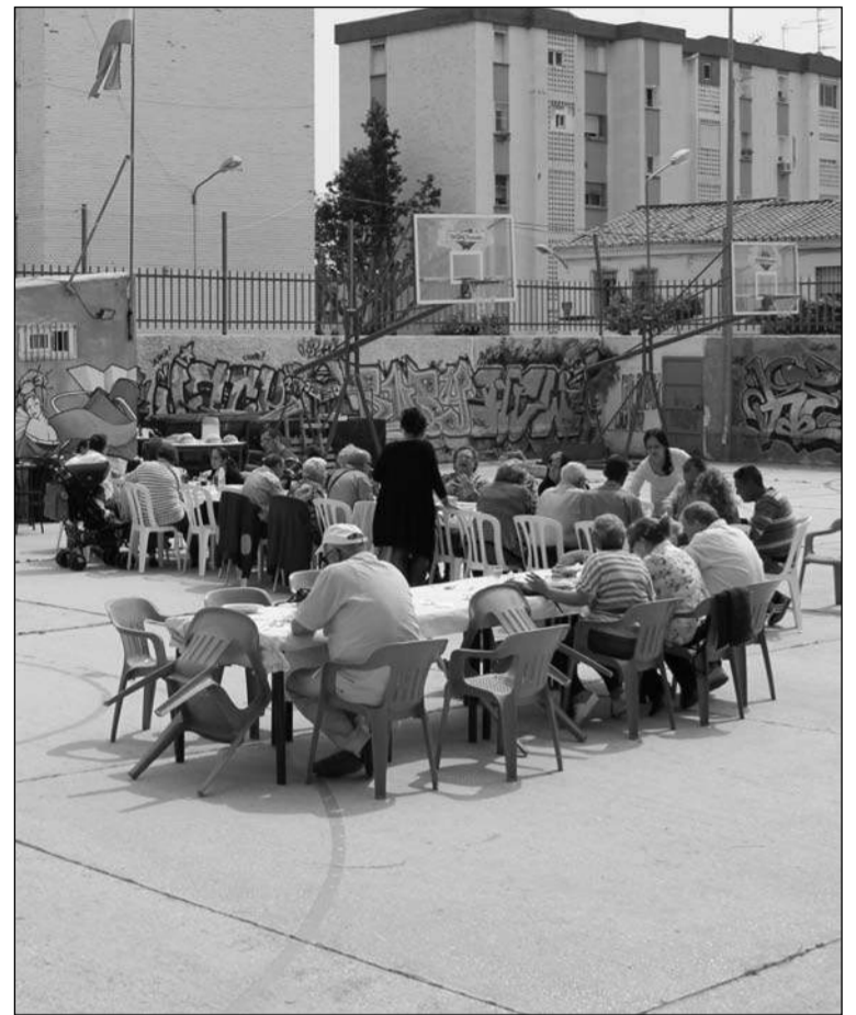
Aprovechando el buen tiempo, el almuerzo se sirvió en el exterior.