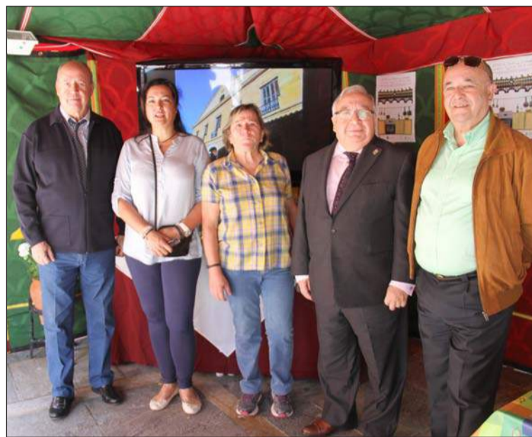
Representantes de la Federación con autoridades de Carratraca.

Ese mismo día se representaba en la plaza de toros del municipio su tradicional representación de La Pasión, una de las grandes tradiciones de Carratraca y que cada año se ofrece en este inmejorable marco en las tardes del Viernes y Sábado Santo.