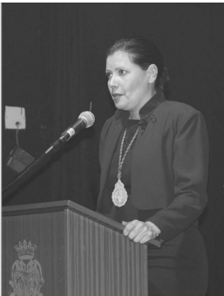
La pregonera, durante su intervención.