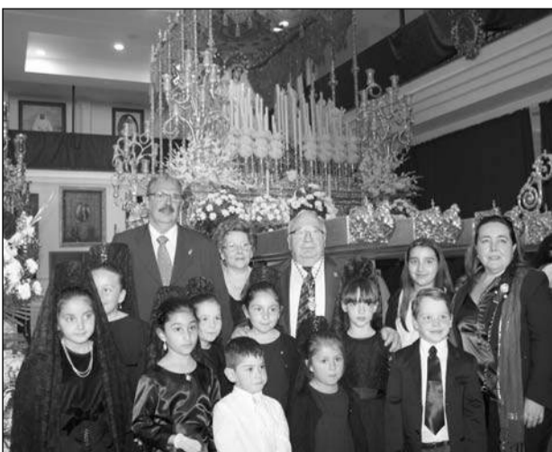
Con el futuro peñista y cofrade, ante la Novia de Málaga.