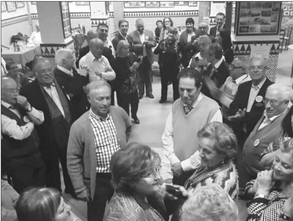
Instante del sorteo realizado en la cena de homenaje a los padres.