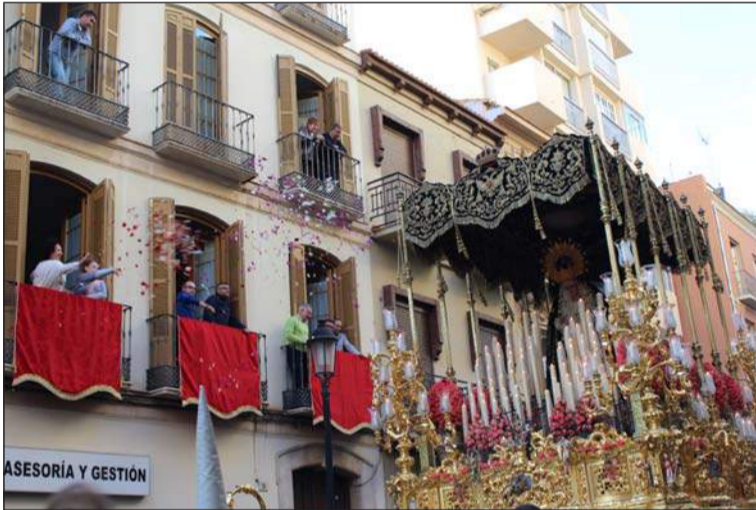
Petalada a la Virgen de la Caridad en calle Victoria.