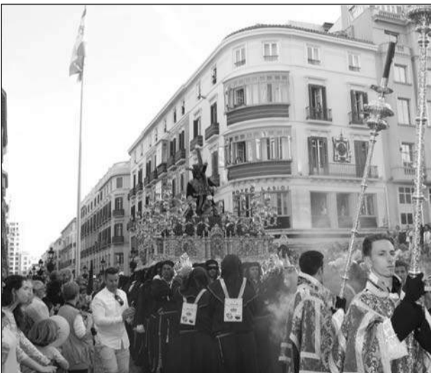
Nazareno de los Pasos por la tribuna.