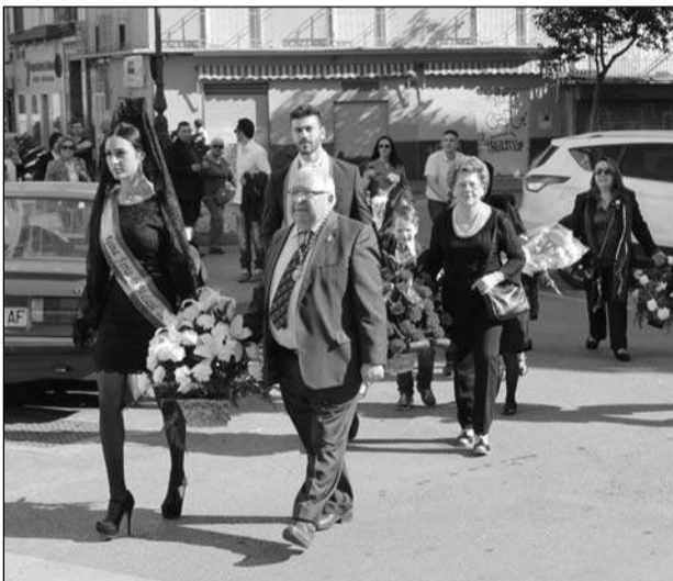
La comitiva aproximándose a la casa hermandad.