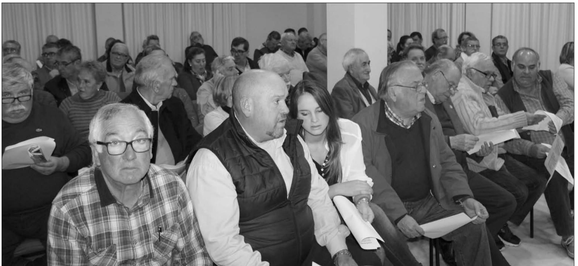
Imagen de la última Asamblea General Ordinaria del colectivo.