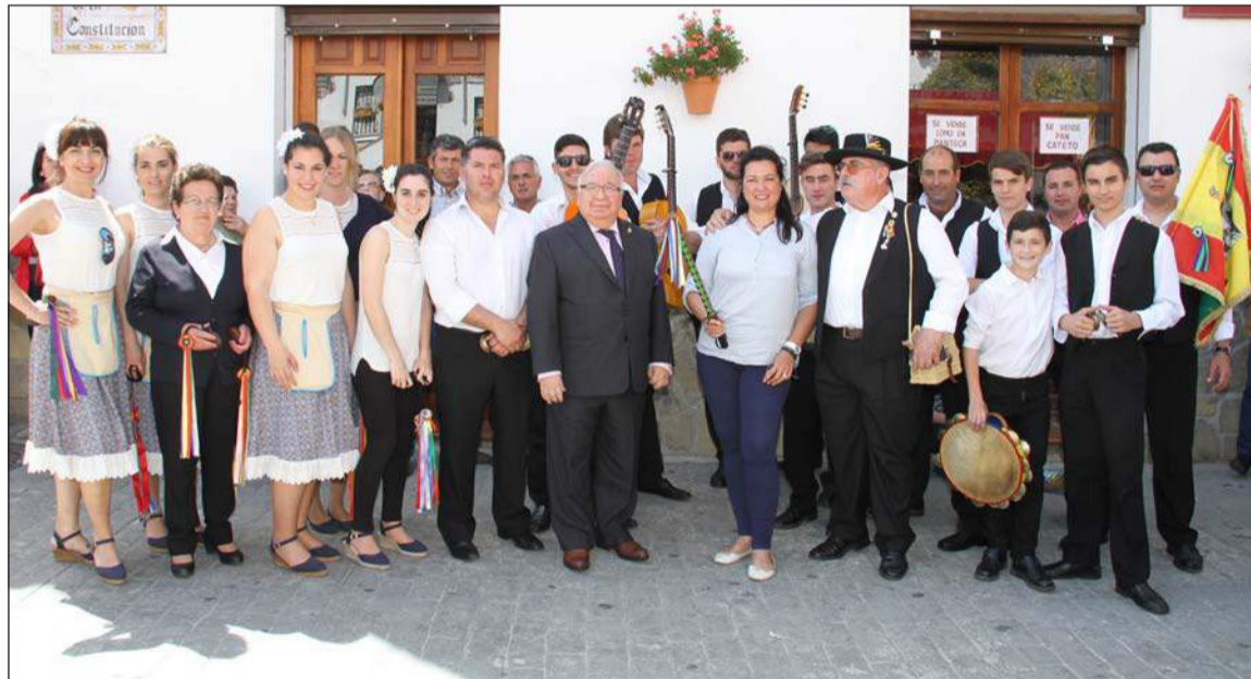
Panda de Verdiales con la alcaldesa de Carratraca y el presidente de la Federación de Peñas.