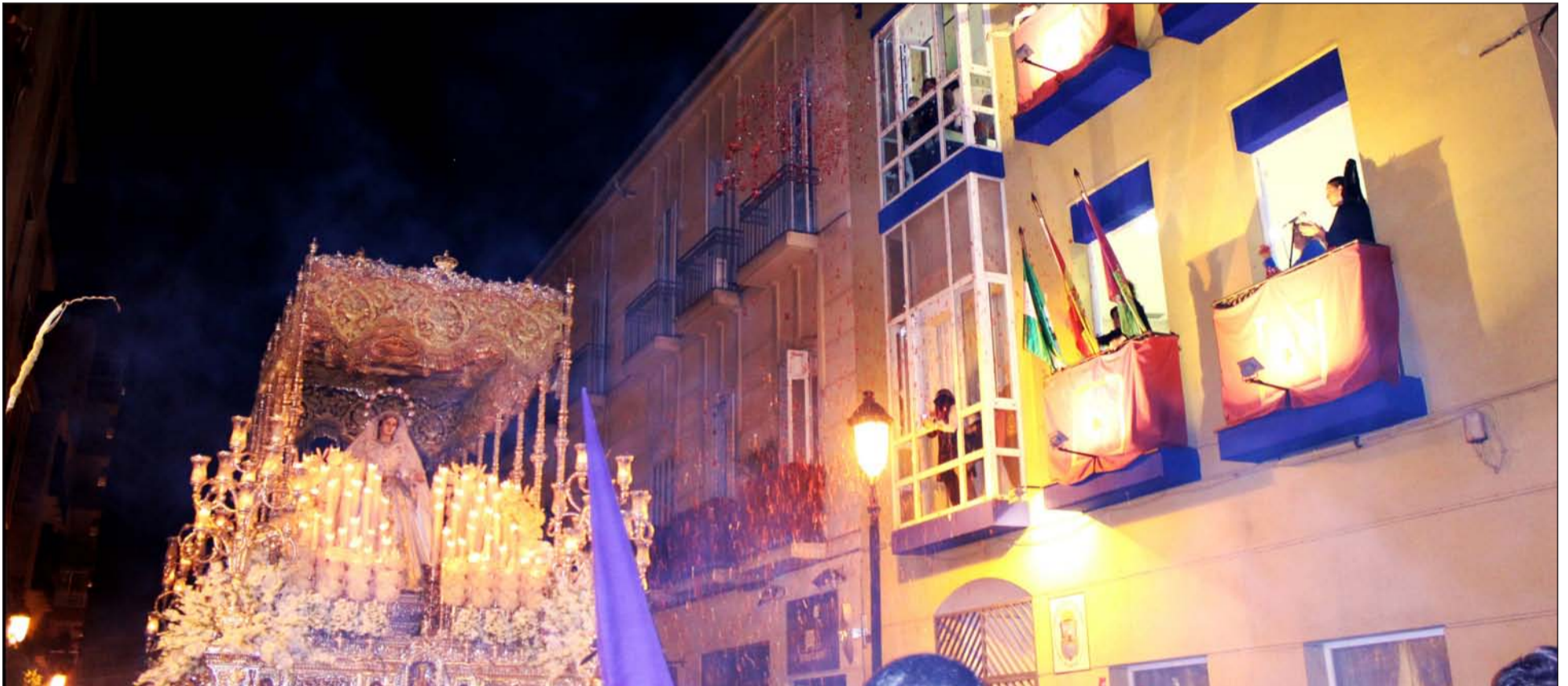
Petalada a la Novia de Málaga desde la sede de la Federación Malagueña de Peñas en la noche del Martes Santo.

El colectivo peñista malagueño, como Hermano Mayor Honorario, participó en la procesión del Rocío