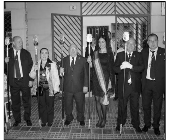
Directivos aguardan el retorno de la procesión en la sede.