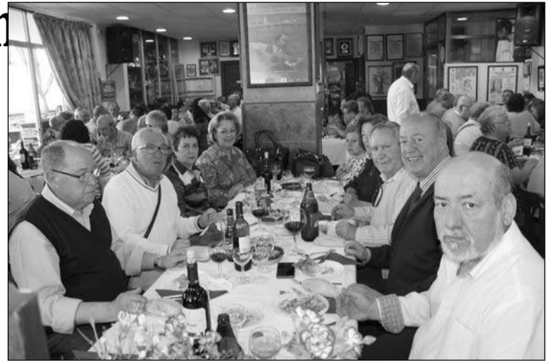
Aspecto que presentaba la sede, repleta de comensales.