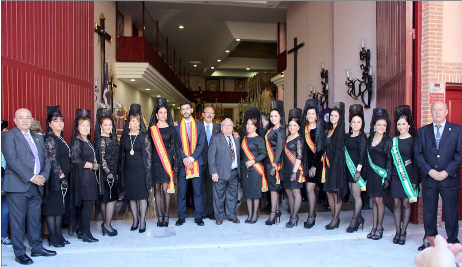
Representantes de la Federación Malagueña de Peñas con el Hermano Mayor del Rocío y Reinas atavidas de mantilla..

Con un tiempo espléndido que no daba lugar a dudas meteorológicas, los peñistas depositaron sus claveles rojos y blancos a los pies de los tronos, que ya estaban dispuestos para la salida procesional del Martes Santo.