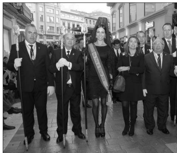
Directivos de la Federación de Peñas con la Reina de la Feria.