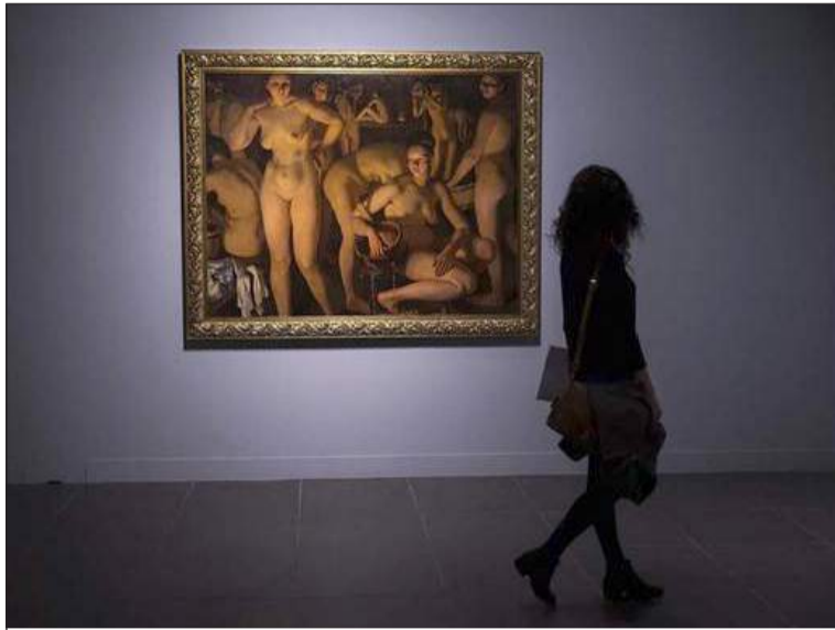
Una de las primeras visitantes a la pinacoteca.