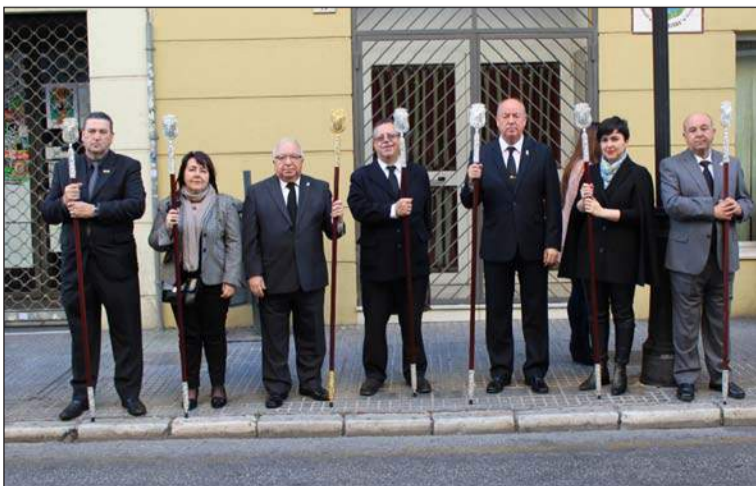
Recibimiento a los Titulares del Amor y la Caridad.