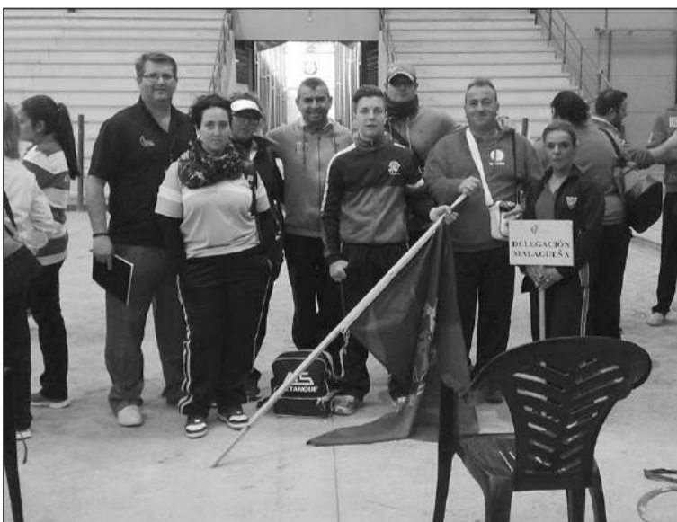
Delegación en el Campeonato de Andalucía.