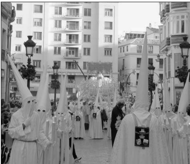
Nazarenos de la Virgen del Rocío, que hace su entrada a Larios.