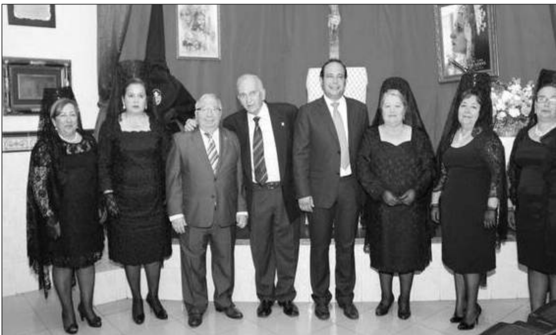
El presidente de la Federación, el de la entidad y el pregonero, con socias vestidas de mantilla.