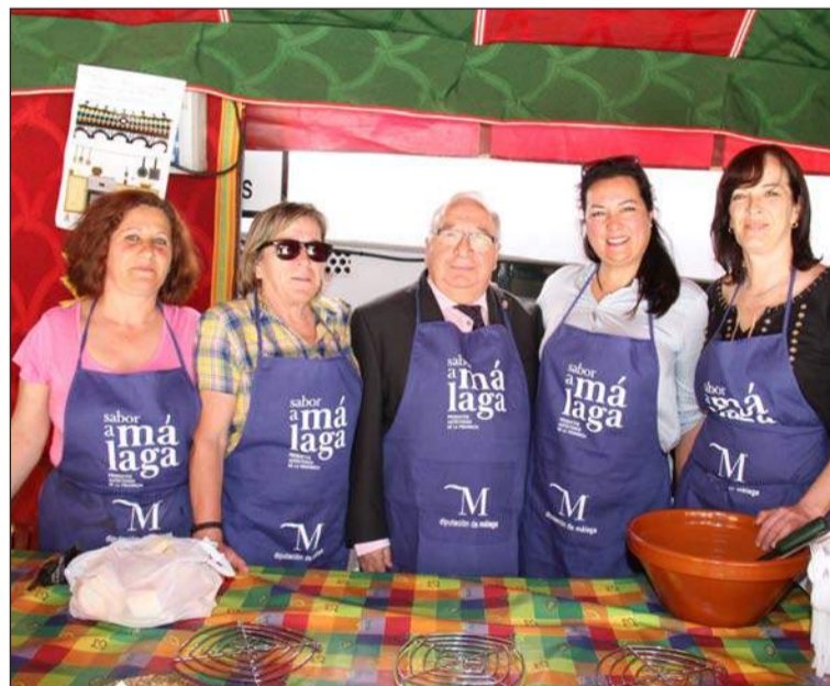
Degustación gastronómica con Sabor a Málaga.

Entidades colaboradoras con esta publicación: