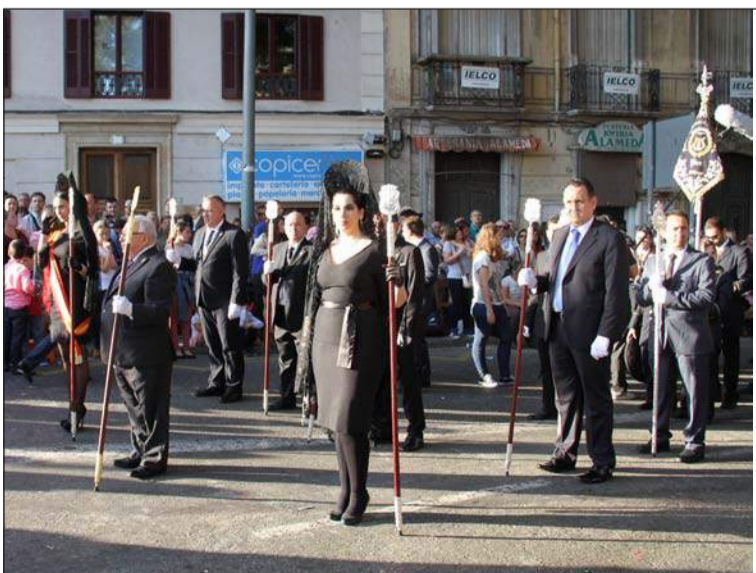
Presidencia de la Federación de Peñas en la Alameda Principal.