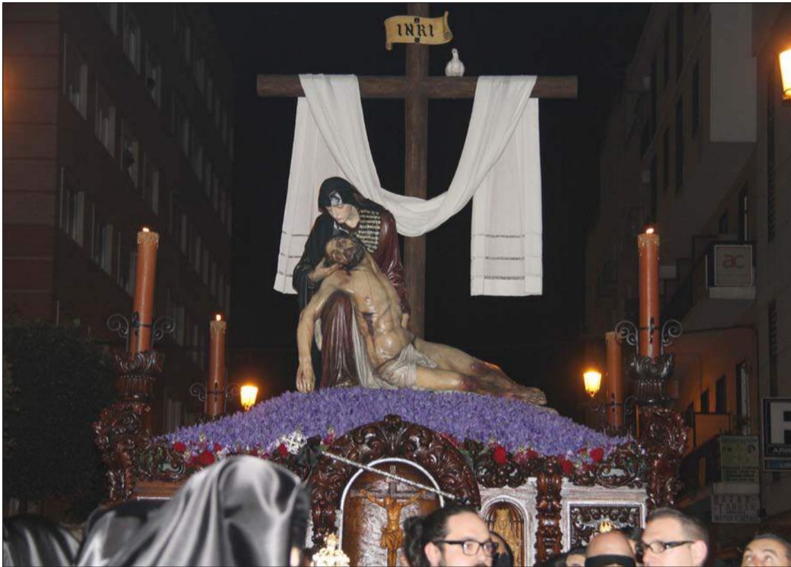
Trono de La Piedad en el pasado Viernes Santo.