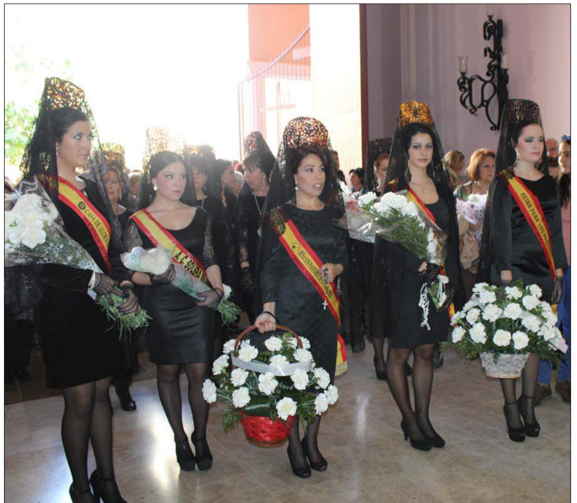
Reinas de entidades realizando sus ofrendas.