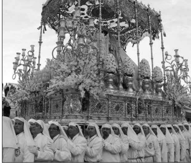
La Novia de Málaga, entrando a la Alameda.