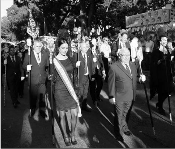
Incorporación de la representación peñista.