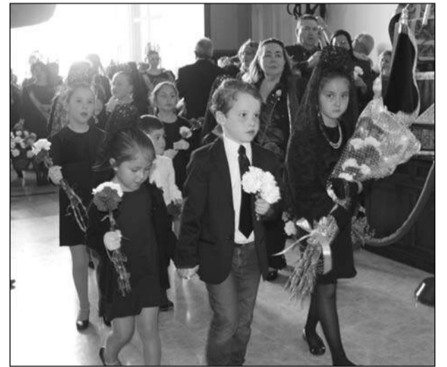
Niñas de mantilla y niño de traje de chaqueta.