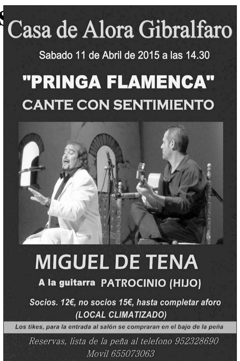
Cartel de esta actividad.