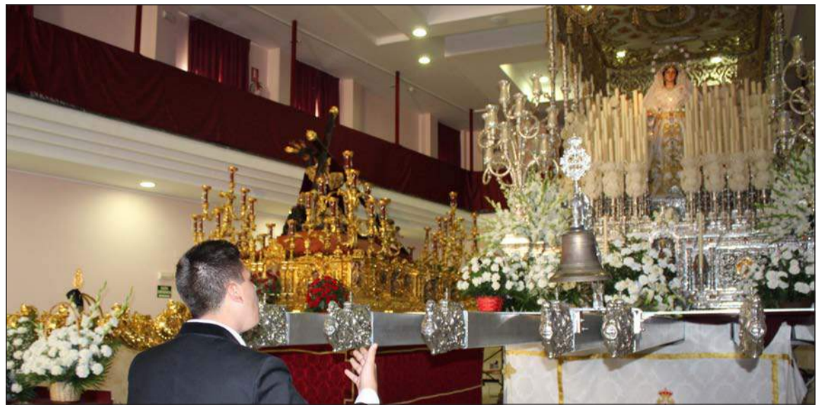
Saeta a los Titulares de la Cofradía Victoriana.

Así, desde la Federación Malagueña de Peñas se quería dar más realce a este acto; así como potenciar el uso de esta prenda tan tradicional en las procesiones de Semana Santa de toda España.