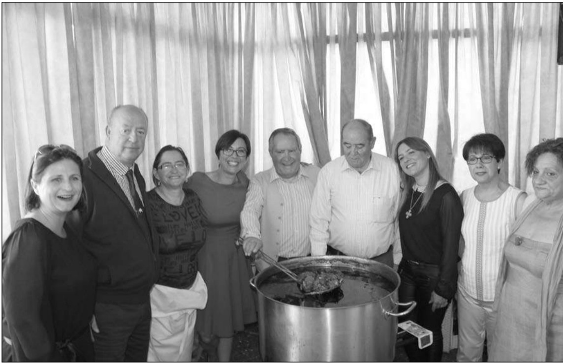
Autoridades e invitados, con componentes de la entidad en los preparativos de la comida.