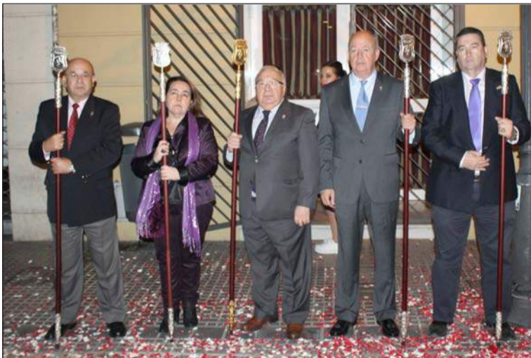
Directiva de la Federación al paso de La Humildad.