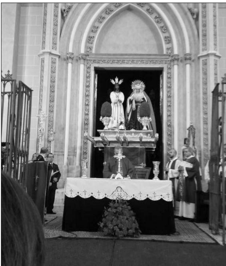
Misa de Alba de Jesús Cautivo y la Virgen de la Trinidad.