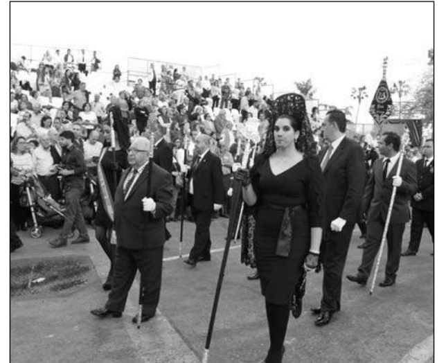
El presidente Miguel Carmona encabezó la presencia peñista.