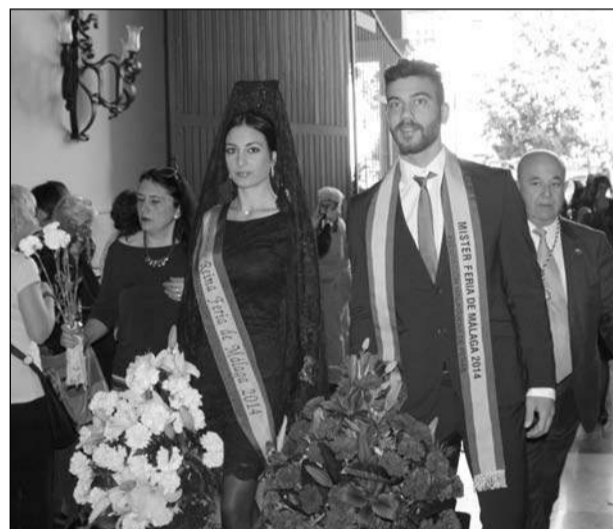
Entrada de la Reina y el Mister de la Feria.