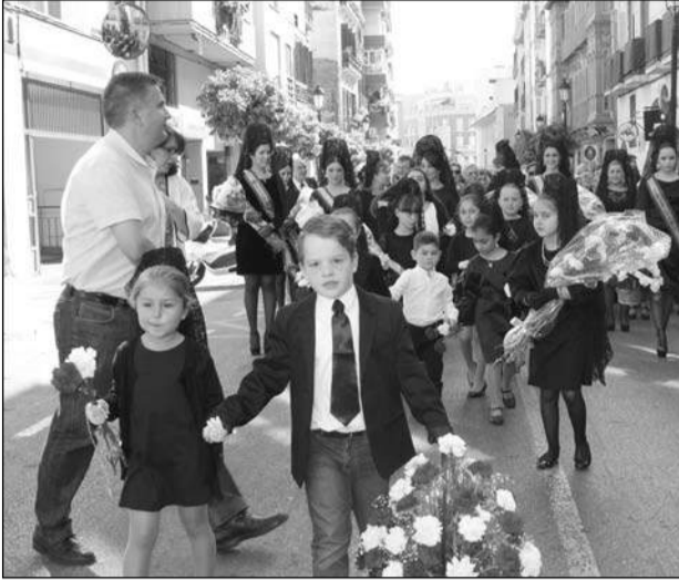
Niños que participaron en la ofrenda.