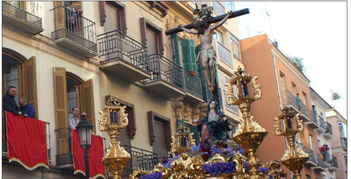
El Cristo del Amor, discurriendo por la calle Victoria, donde se encuentra la sede de la Federación de Peñas.

los Sagrados Titulares de la Real Cofradía del Santísimo Cristo del Amor y Nuestra Señora de la Caridad, que venía desde su casa hermandad de la calle Fernando el Católico, y posteriormente hacía su paso la Muy Antigua y Venerable Hermandad del Santo Cristo del Calvario y Via Crucis y Cofradía de Nazarenos del Santísimo Cristo Yacente de la Paz y la Unidad en el Misterio de Su Sagrada Mortaja, Nuestra Señora de Fe y Consuelo, Santa María del Monte Calvario y San Francisco de Paula, que ya regresaba al Santuario de la Victoria.