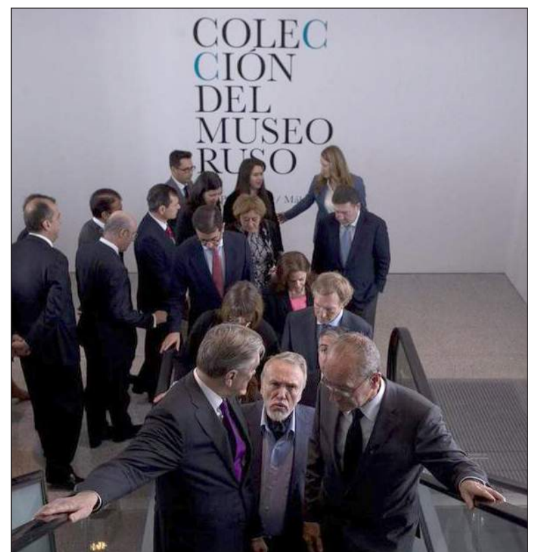
Autoridades durante el acto de apertura.

de esta filial mediante la Agencia Pública para la Gestión de la Casa Natal de Pablo Ruiz Picasso y otros Equipamientos Museísticos y Culturales. Se han destinado este año al proyecto 3,7 millones de euros, a los que hay que sumar los 580.000 euros de la adaptación del edificio.