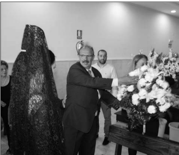
El Hermano Mayor recibe las flores entregadas por la Reina.