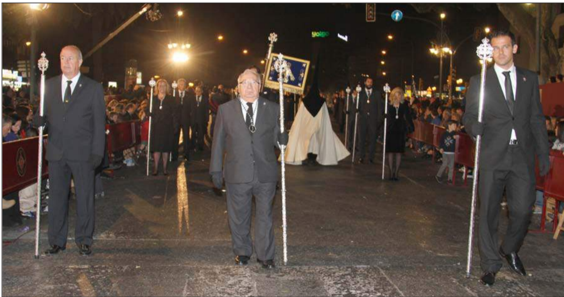
Representación de la Federación de Peñas en la presidencia de la procesión.