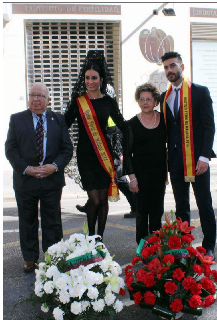
La Reina y el Mister con el presidente de la Federación y su esposa.