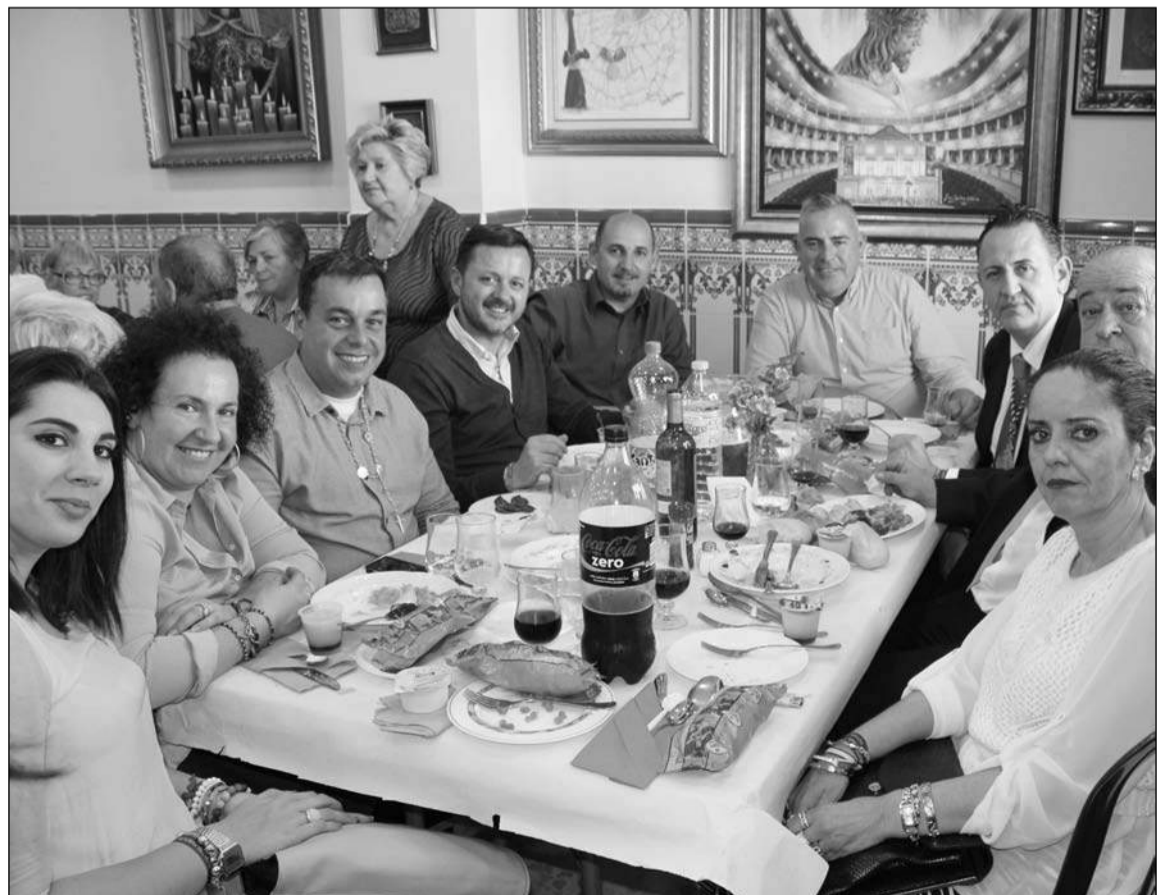
El presidente y su esposa, a la derecha, con representantes de la Federación y otros invitados.