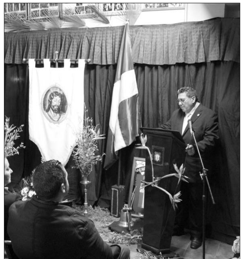
La sede se cubrió de romero en la exaltación.