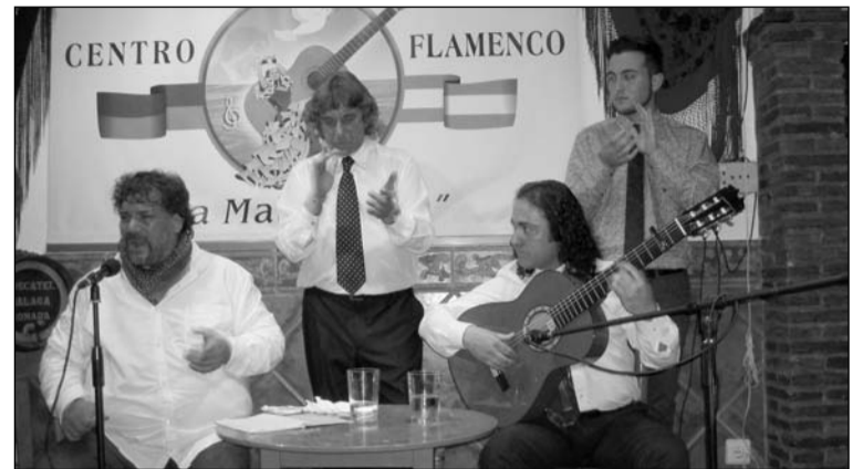
Un instante de la actuación.