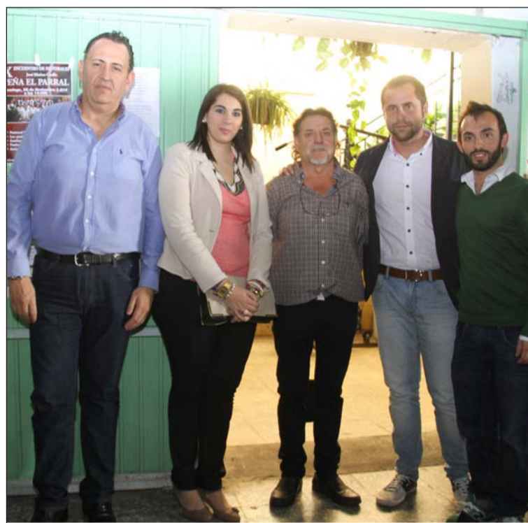
Representantes de la Federación y del Ayuntamiento, con el presidente.