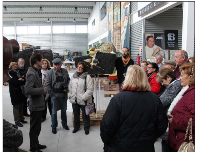
Visita al museo Berrocal.

Esta es la segunda visita a un pueblo de nuestra provincia que realiza la Federación de Peñas tras el realizado a Estepona. En fechas próximas se realizarán nuevas visitas.