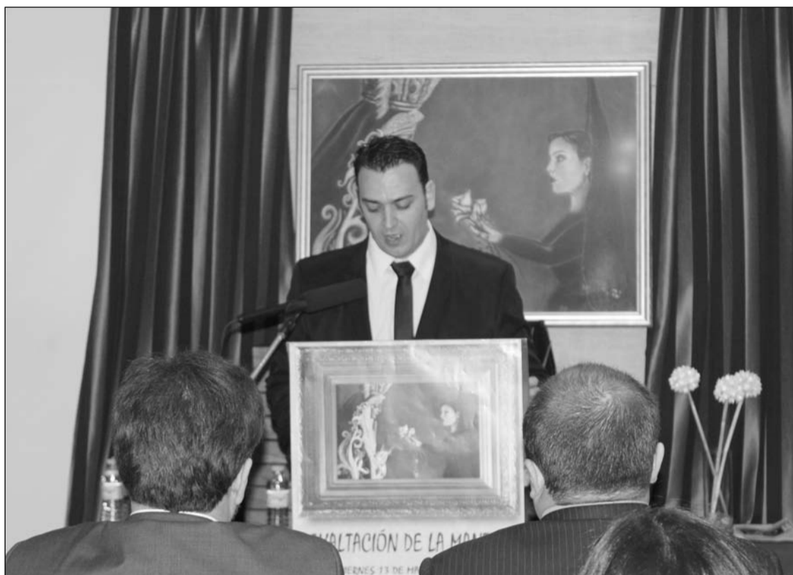
Un instante de la exaltación.