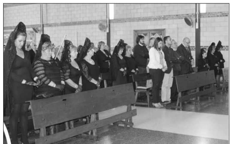
La actividad contó con una gran participación.

Numerosos niños se congregaron en la sede de la entidad para pedir un autógrafo de sus ídolos malaguistas.