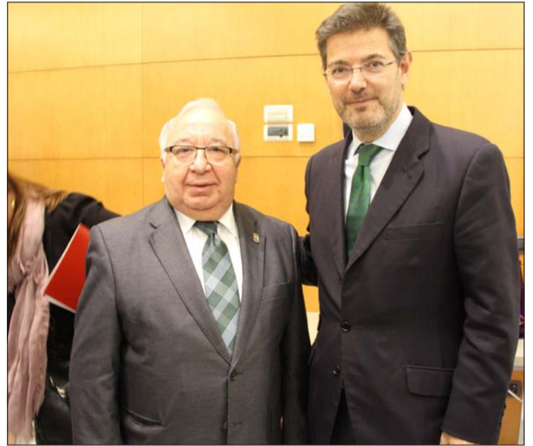
El presidente Miguel Carmona con el ministro de Justicia.