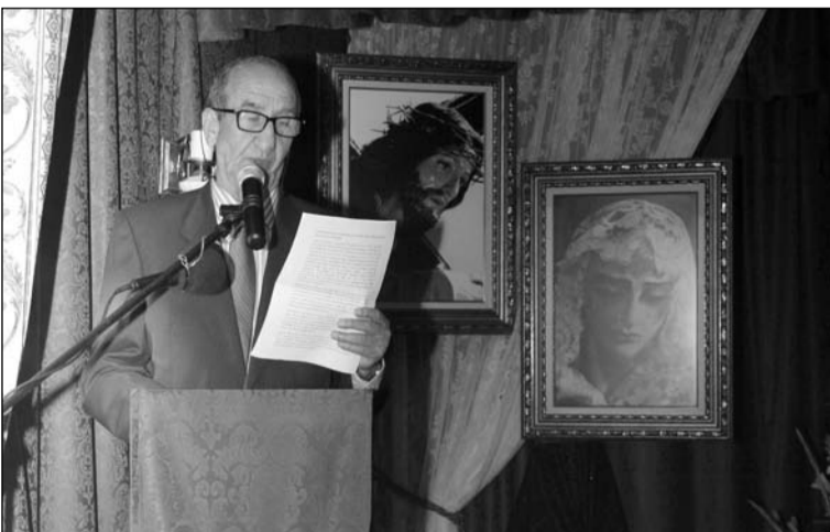
Se dedicaron poemas en el transcurso del acto.

El acto tuvo lugar en la sede de esta entidad perteneciente a la Federación Malagueña de Peñas, Centros Culturales y Casas Regionales 'La Alcazaba', situado en la calle La Vega 5 de esta barriada malagueña.