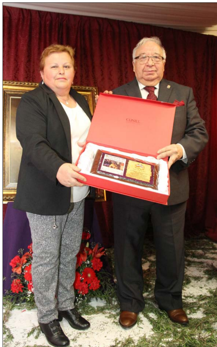
Entrega de un recuerdo al pregonero.