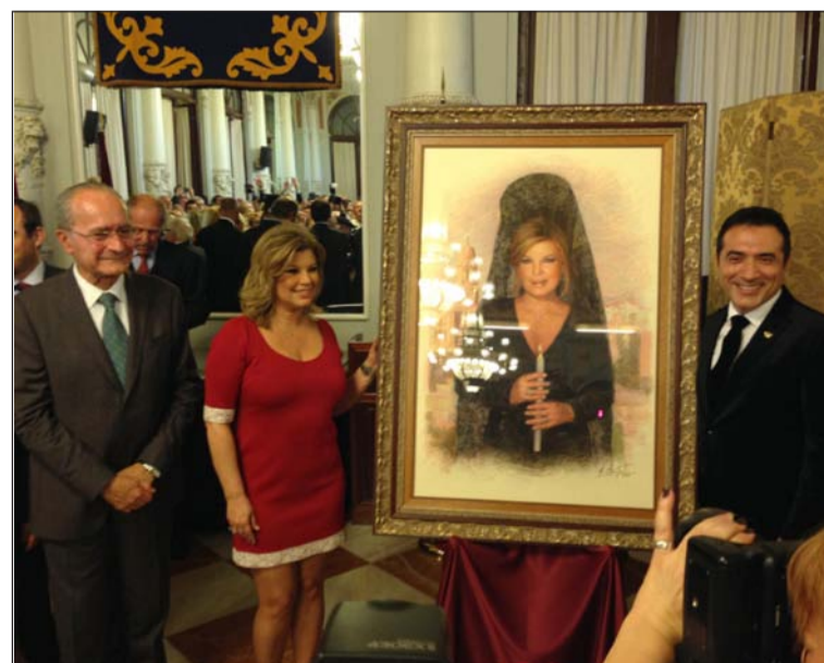
Presentación del cartel.

Entre los asistentes estaban también los presidentes de la Agrupación de Cofradías y la Federación de Peñas.