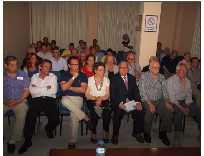
Última asamblea de elecciones celebrada en mayo de 2013.

Todo presidente que por gestión se haya expulsado a su entidad, no podrá presentarse a la presidencia de esta Federación; al igual que si tiene abierto expediente de expulsión, salvo que hubiera sido presidente de la Federación, siempre que no haya sido el causante de la expulsión.