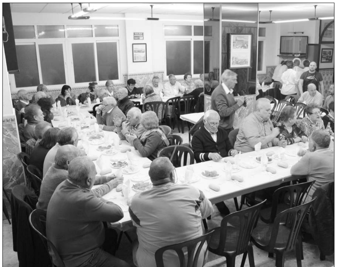
Apecto que presentaba el salón de la entidad.