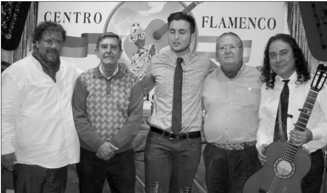
Artistas flamencos con socios de la entidad.