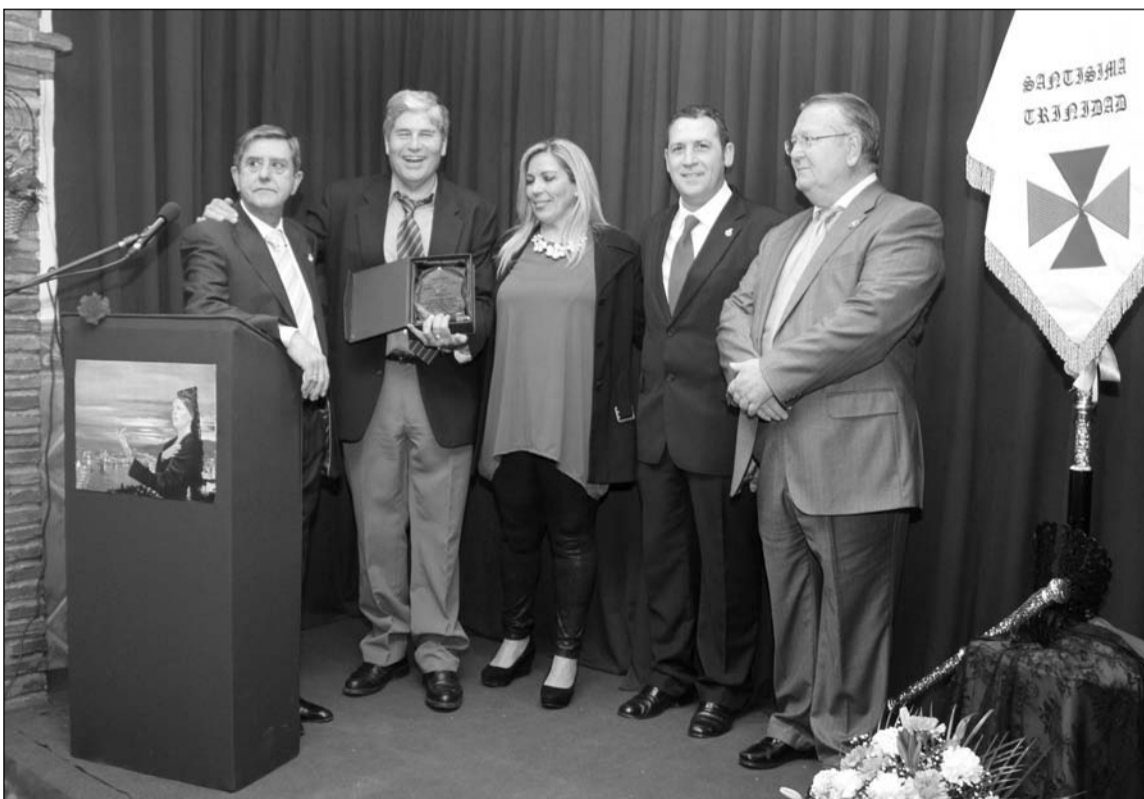
Acto cofrade en la sede del centro.

Se contó con la presencia de numerosas socias ataviadas con la clásica mantilla española, que dieron más realce al acto.