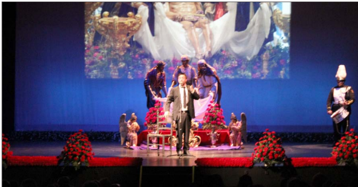
Espectacular decorado con las imágenes del antiguo grupo escultórico del Santo Traslado.