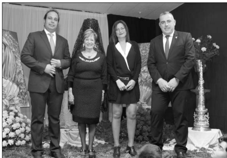
Presidencia del acto cofrade en el escanario de la entidad.

desde las 14:30 horas con una nueva Pringá Flamenca en la que se anunciaba la actuación de Regina de Huelva y su Cuadro Flamenco.