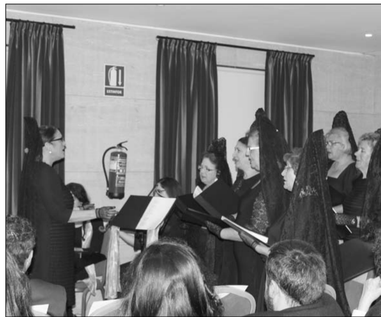
Coro de la asociación.