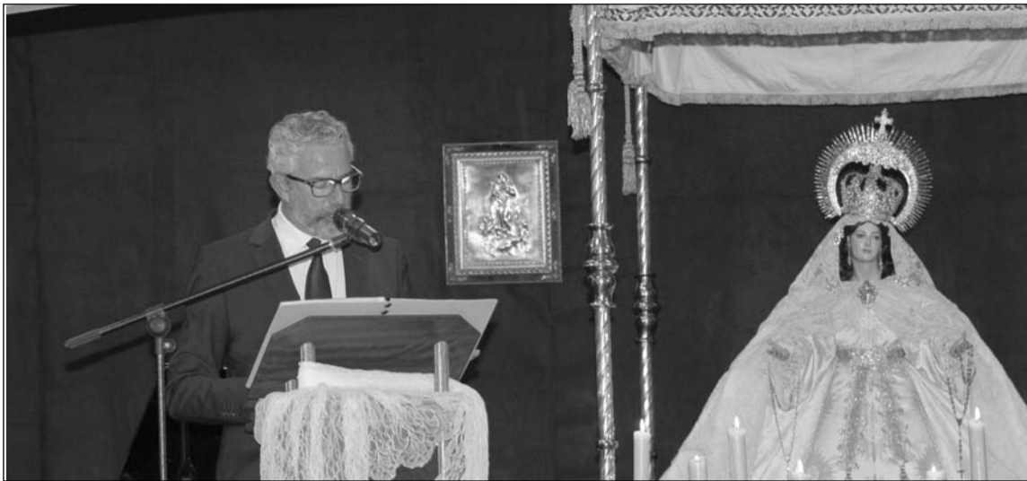
Un instante del pregón.