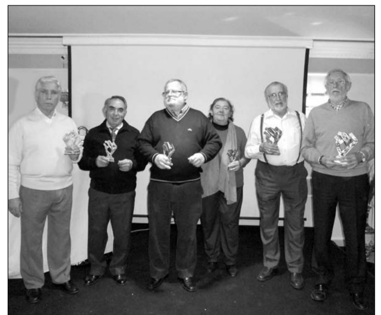
Entrega de premios.

El pasado sábado se proyectaba la película 'Origen', mientras que el 2 de abril, a las 14:00 horas celebrarán el tradicional Almuerzo de Jueves Santo.