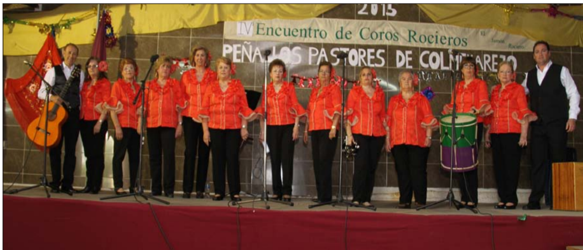
Actuación de uno de los coros.