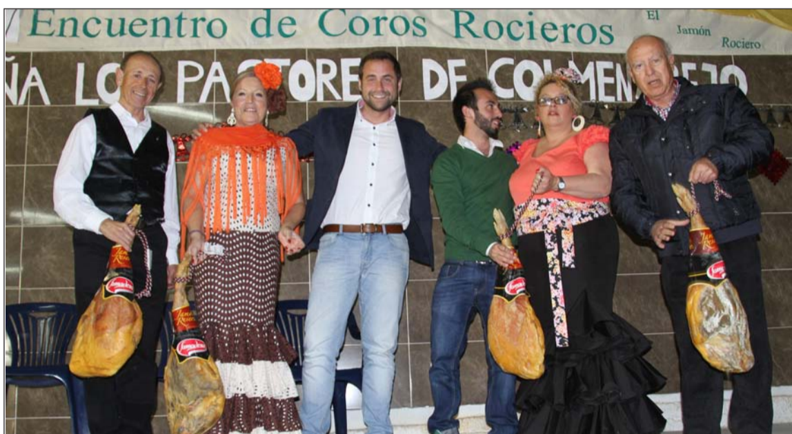
Entrega de jamones a los coros participantes.