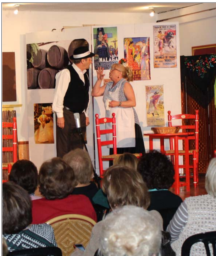
Representación del grupo de teatro del C.C. Renfe.

Debido al éxito de estas comidas para mujeres, son numerosas las entidades que se han ofrecido para acoger nuevas ediciones en sus sedes.