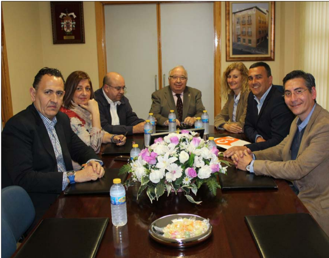
Un instante del encuentro mantenido en la sala de juntas.