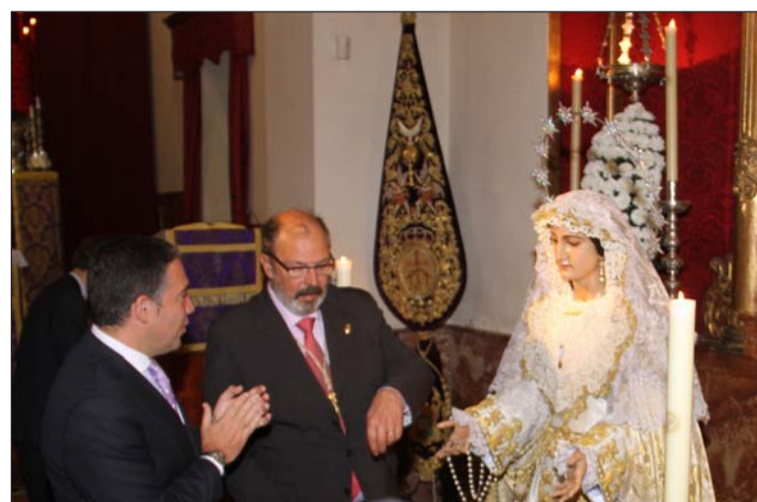
Acto de imposición del escudo de oro.