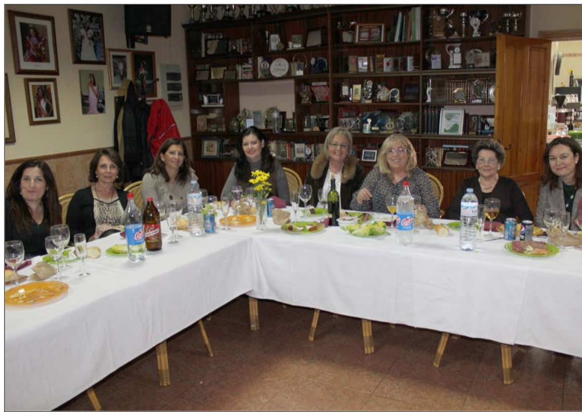
Mesa con algunas de las autoridades asistentes y las organizadoras.