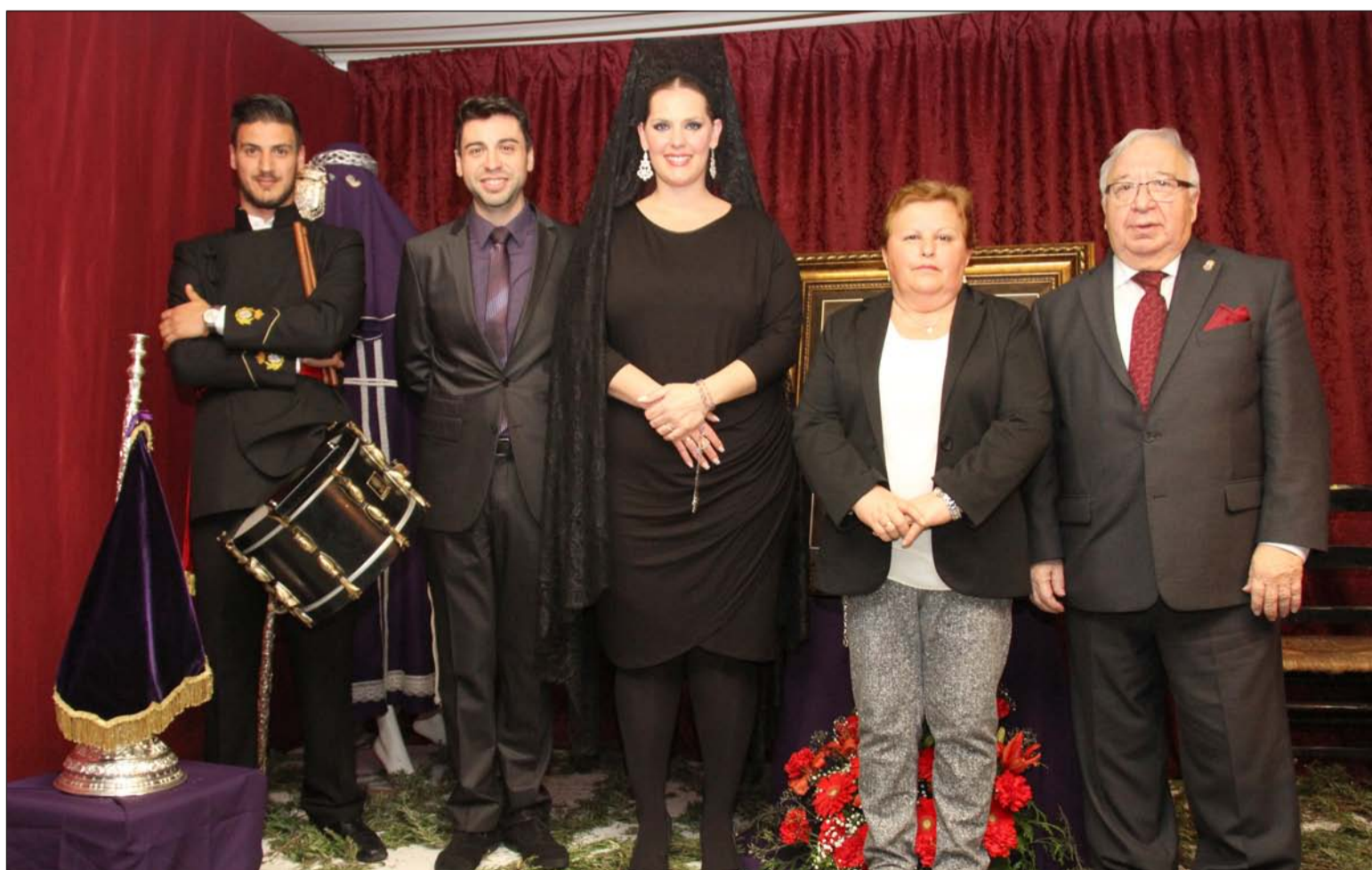
Participantes en la exaltación, con la presidenta de la entidad.