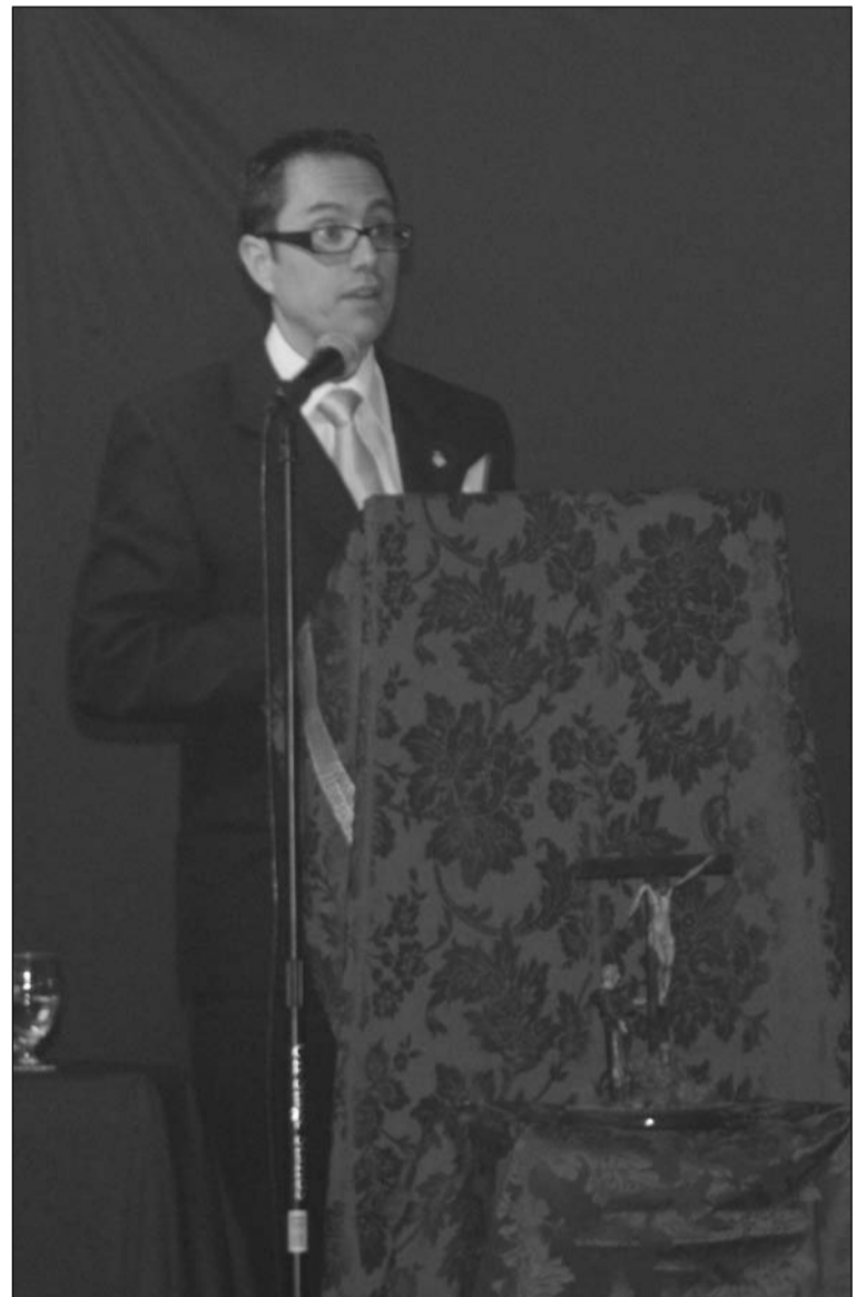
Intervención del pregonero.