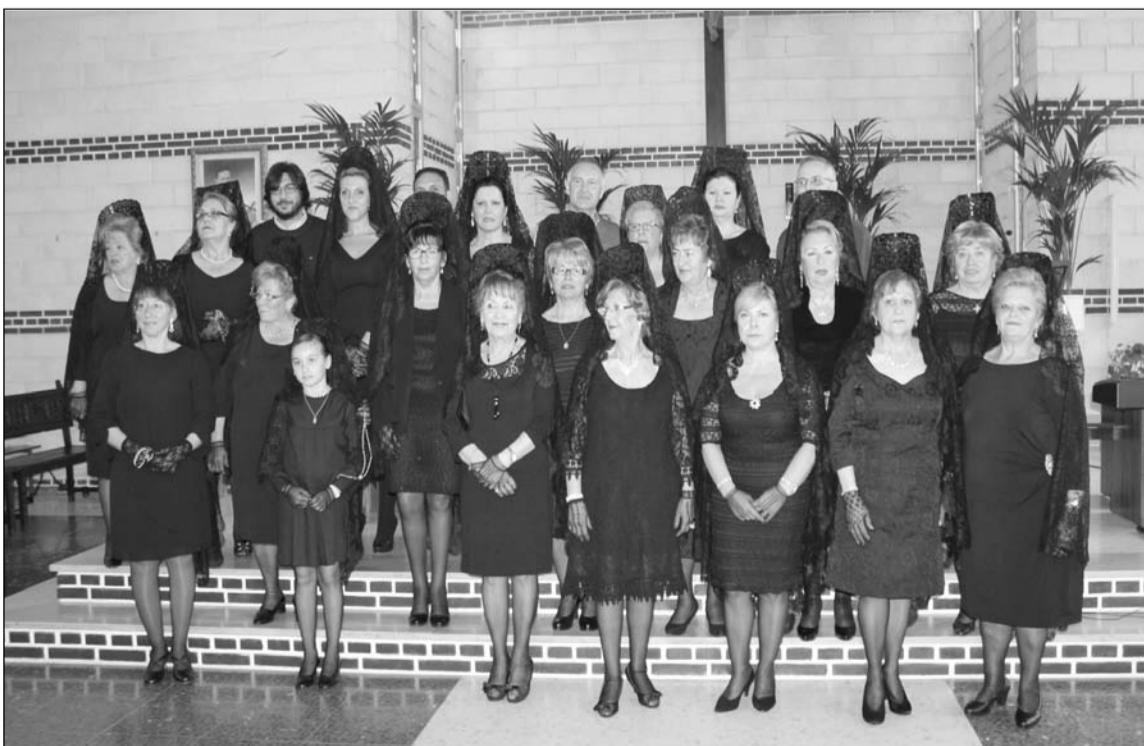
El pregonero y su presentador, con socias luciendo la mantilla española.