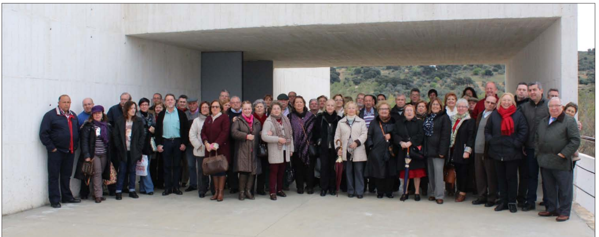
Peñistas que se desplazaron hasta la localidad de Villanueva de Algaidas.