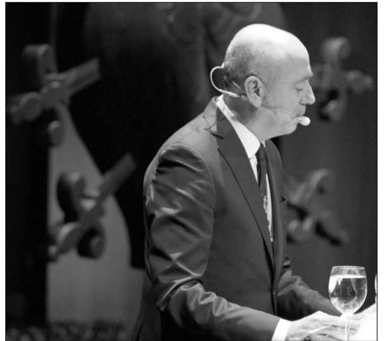
El pregonero, en el escenario del teatro Cervantes.

Durante poco más de dos horas ofreció un pregón de profunda raigambre cristiana, eclesial y poético. Además, con un profundo carácter mariano que ha enganchado con el más hondo sentimiento cofrade. El texto tuvo una alta carga teológica y social.