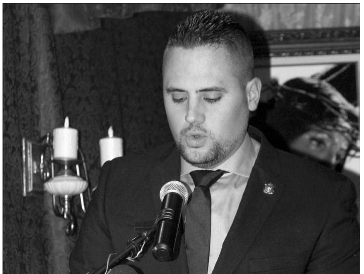
Un instante del pregón.