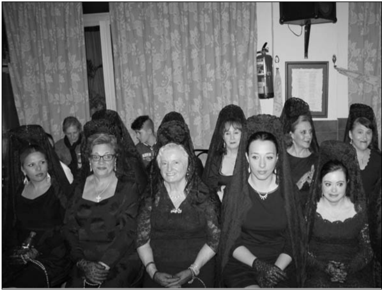
Socias luciendo la mantilla.