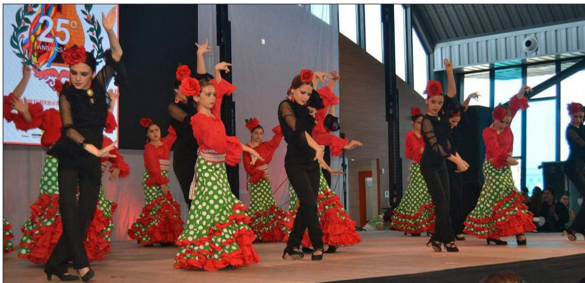
Una de las actuaciones de la gala.