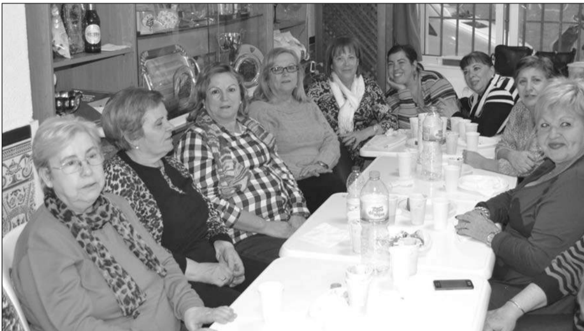
Merienda con motivo del Día Internacional de la Mujer.