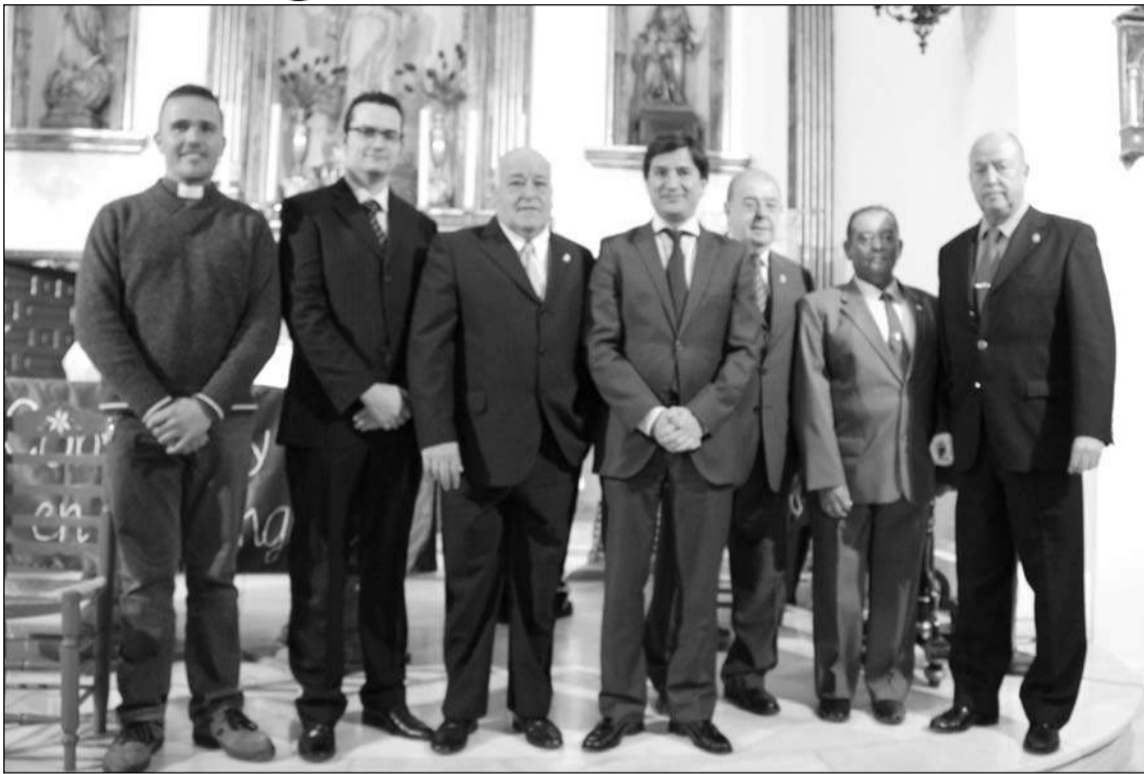
Última semifinal celebrada en Monda.