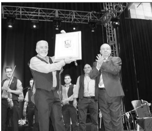
Entrega de un recuerdo al alcalde de la panda de verdiales.