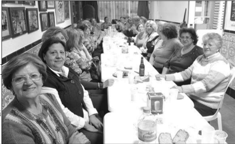
Socias disfrutando de la merienda.

Asistieron treinta y ocho mujeres, que entre chistes y canciones pasaron una tarde muy amena.