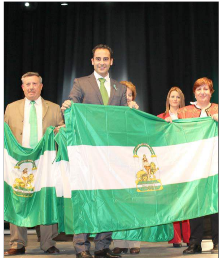
Entrega de banderas de Andalucía.

Hay cosas que son exclusivamente malagueñas