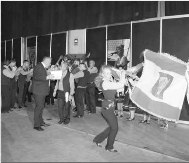
La Panda de Verdiales de Almogía dió la bienvenida al