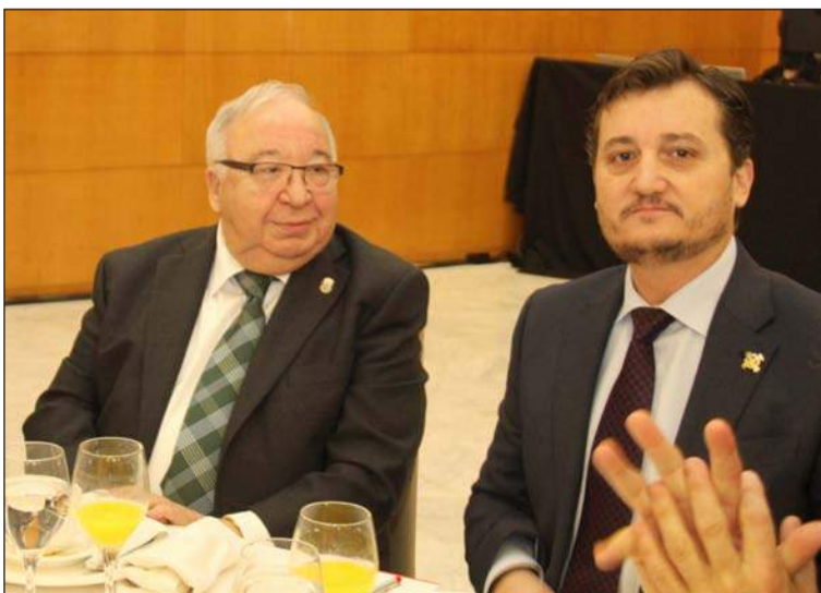
Los presidentes de la Federación de Peñas y Asociación de Cofradías.

quienes tuvieron la ocasión de intercambiar impresiones con la responsable de la cartera de Fomento en el Gobierno de España.