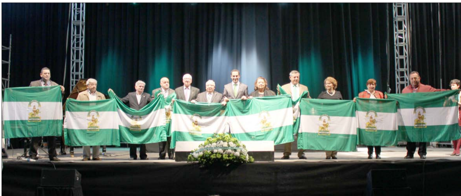
Entrega de banderas andaluzas en el transcurso del acto conmemorativo del 28 de febrero.

Número 570 11 de Marzo de 2015 C/ Pedro Molina, 1 Tfno: 952 22 54 39 Fax: 952 21 48 82 E-mail: prensa@femape.com - la_alcazaba@hotmail.com Web: www.femape.com Edición digital: www.femape.com/laalcazabadigital Twitter: @FMPLaAlcazaba Búsquenos también en Facebook