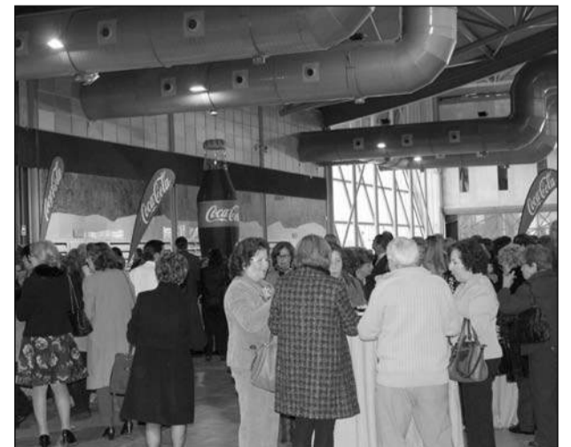
Aperitivo servido a la conclusión del acto.