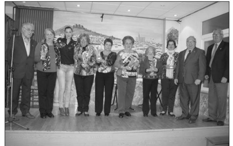
Entrega de trofeos de parchís.

En el transcurso de este acto, además, durante los días 21 y 22 de marzo, los socios disfrutarán de una estancia de fin de semana en un establecimiento hotelero de Torremolinos.