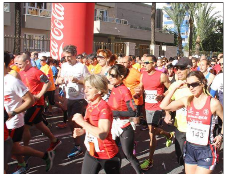
Salida de la prueba en la calle Frigiliana.