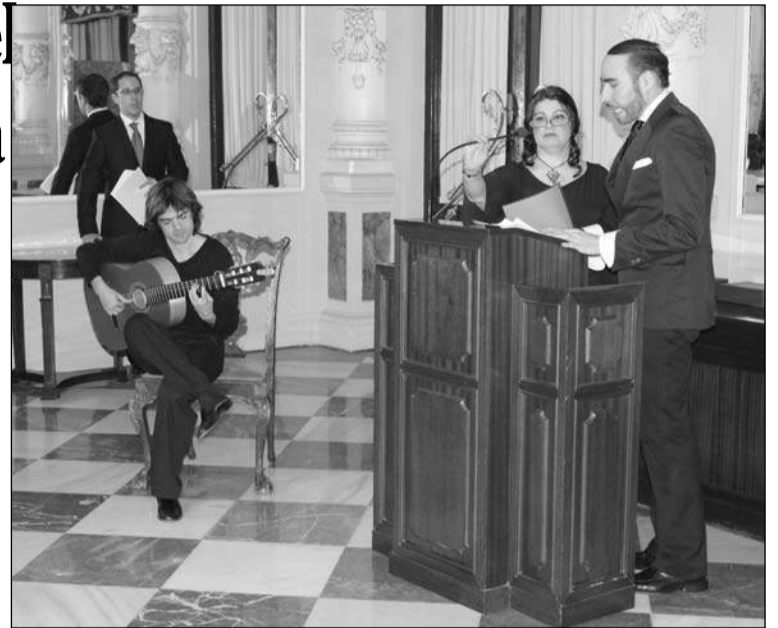
Un instante de la presentación.