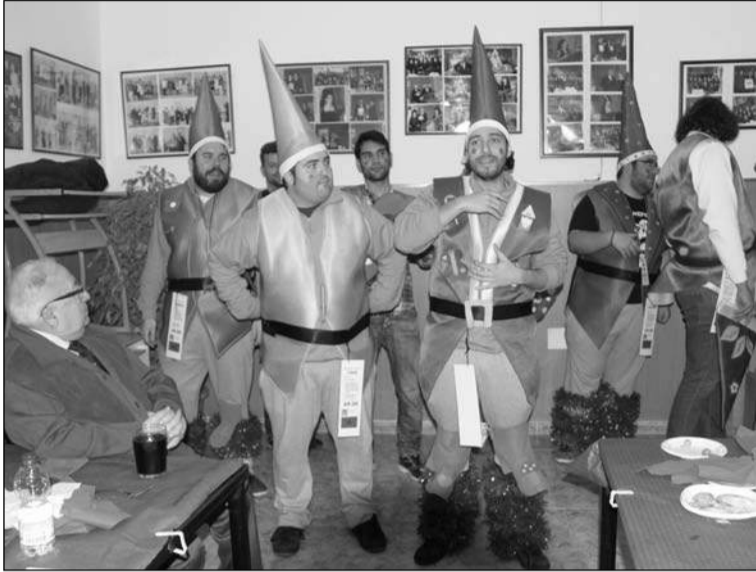
Actuación de una murga.