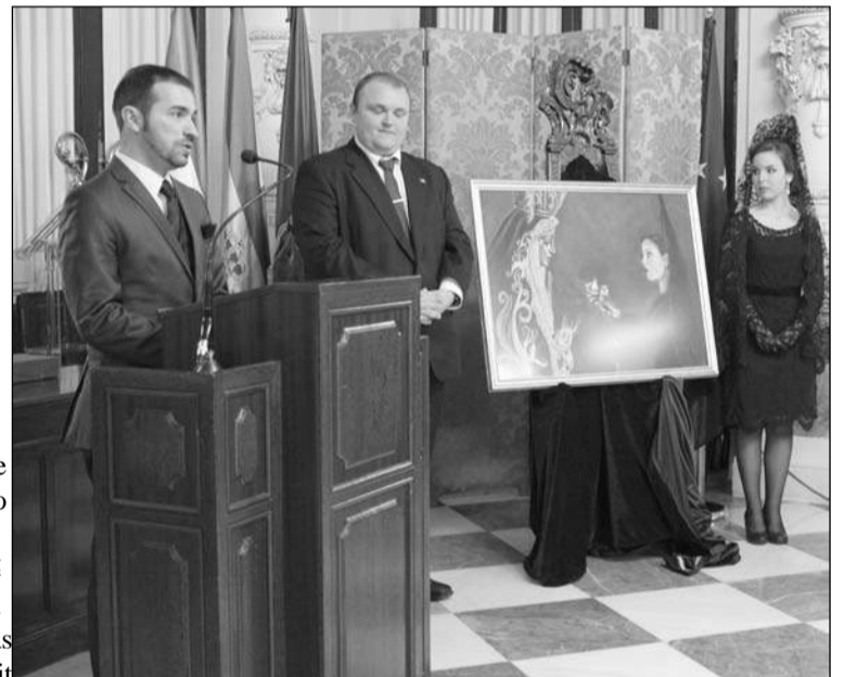
El autor del cartel explica su obra.