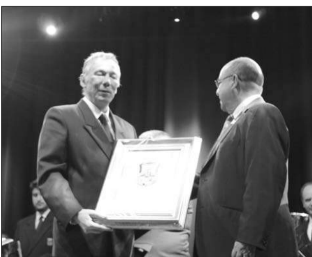
Entrega de un recuerdo al director de la Banda Municipal.