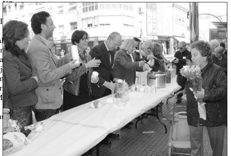
Autoridades reparten el desayuno a los vecinos.