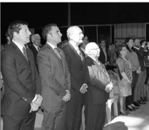
Interpretación del himno por el artista nerjeño.