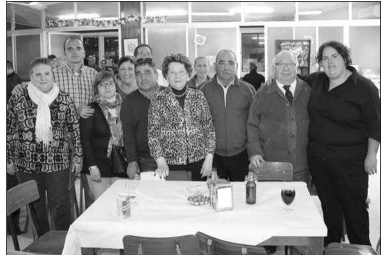
El presidente de la Federación con socios de El Tomillar.