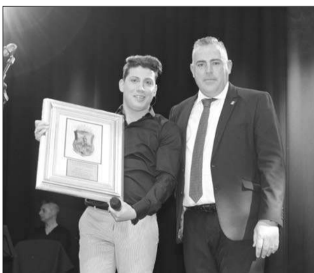
Entrega de un recuerdo al cantante Antonio Cortés.