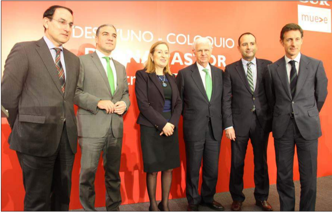
La ministra, con los organizadores del coloquio y autoridades malagueñas.