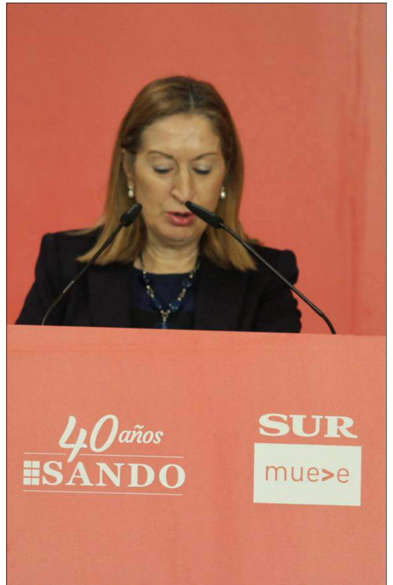
La ministra Pastor, durante su intervención.