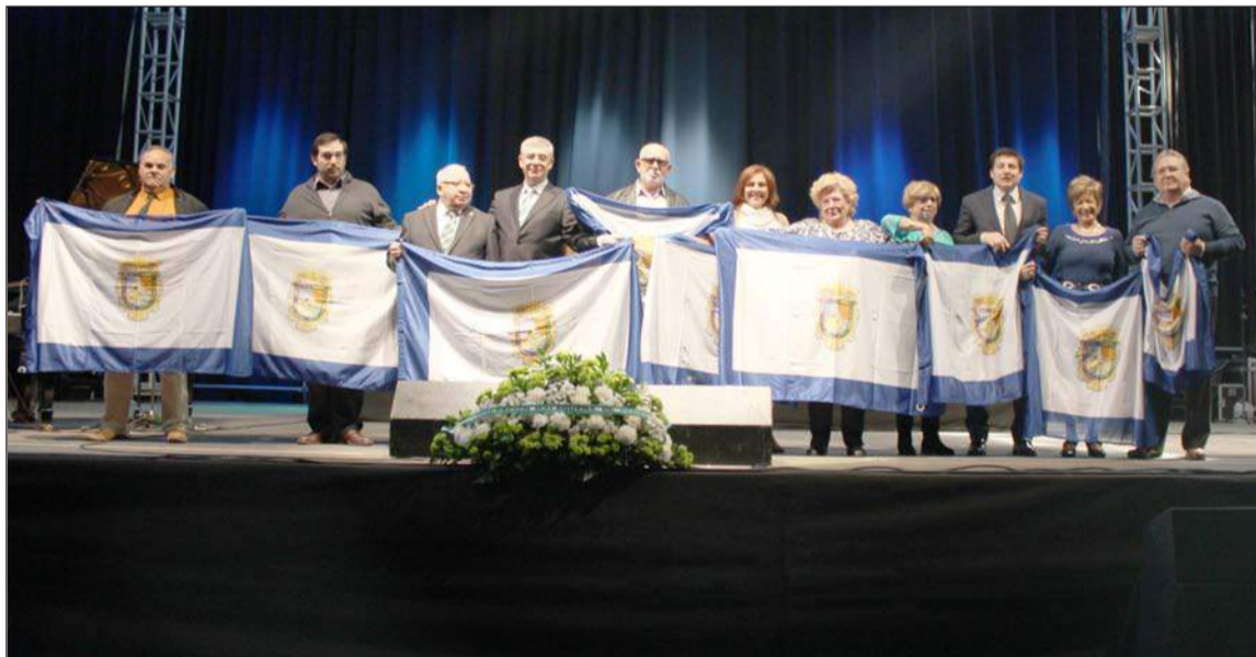
Banderas de la Provincia de Málaga.