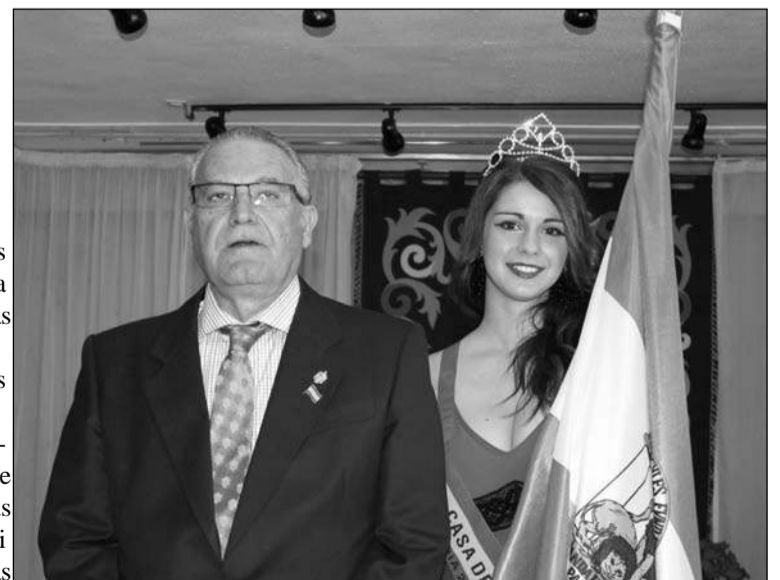
El presidente de la entidad con la Reina de la Feria de la Casa de Melilla.