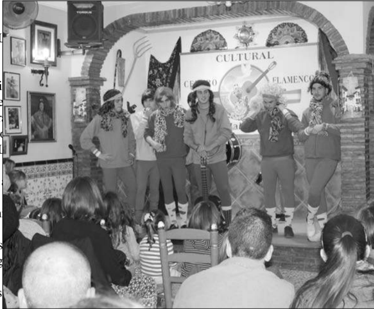
Actuación de una murga.

Además, se siguen celebrando las tertulias flamencas todos los martes de 19 a 21 horas.