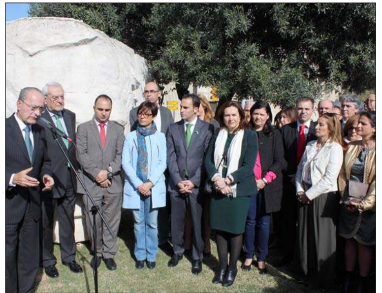
Intervención del alcalde, en presencia de las restantes autoridades.

Una vez finalizado este acto, la mayoría de los participantes se desplazaron hasta el Palacio de Ferias y Congresos, donde se celebraba el acto organizado por el colectivo peñista.