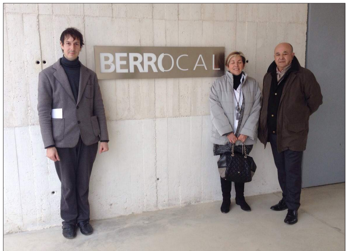
Imagen de la visita realizada hace unas semanas para preparar la excursión.

Igualmente, de cara a fechas cercanas se están planteando nuevas excursiones a otras localidades de nuestra provincia, en las que se crearán lazos de unión con estos municipios para que con posterioridad puedan ser visitados por todas las entidades federadas que así lo consideren oportuno.