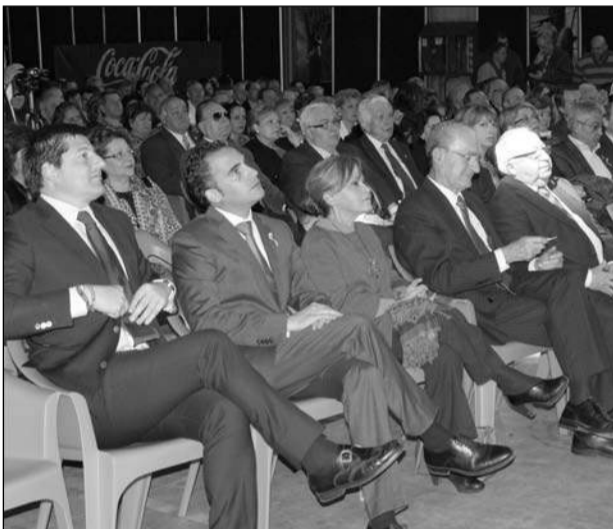
Presidencia del acto.