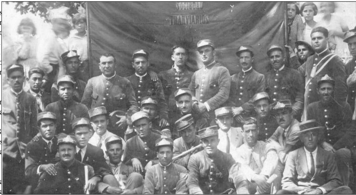
Asociación de tranviarios de Málaga, 1927.

Las primeras líneas de tranvías llegan a España en 1861. Madrid las inaugura en 1869, dos años después se instalan en Barcelona, posteriormente, Sevilla, Cartagena, Bilbao, Santander, y Málaga, ya en 1889, posía cuatro trazados tranviarios en la ciudad: Tranvía Urbano Municipal, Málaga-Arroyo de la Caleta, Tranvía de Málaga-Vélez y el Estacional Tranvía de los baños. Sus 17 vagones estaban tirados por mulos, era lo que denominaba tracción de sangre, y propietaria de esta concesión era la Compañía inglesa, Málaga Tranways Company Limited. Poco tiempo después, en 1898 hay una cesión por parte de esta compañía tranviaria a otra belga, denominada Tranways de Málaga Societe Anonyme, aunque la escritura de transferencia y enajenación no fue efectiva hasta 1903. Tarareando al Don