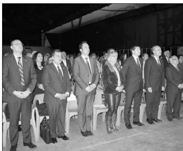
Autoridades escuchando los himnos de Andalucía y España.