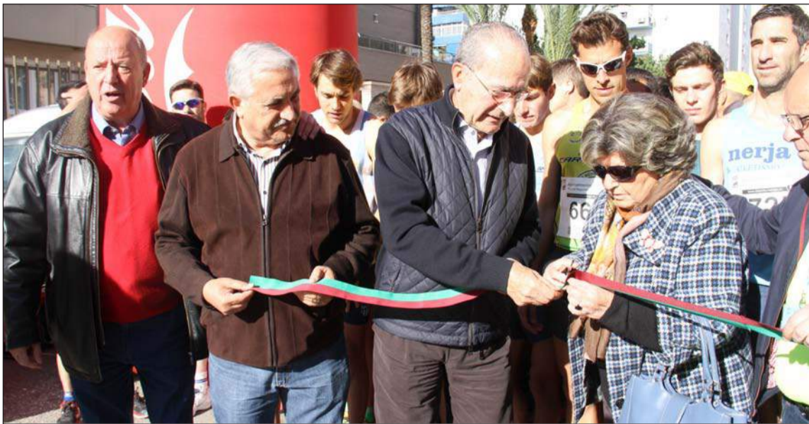
Momento del corte de la cinta en el inicio de la prueba.