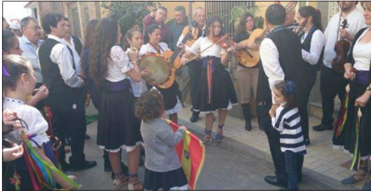
Panda Escuela de Verdiales en el Día de Andalucía.

La Peña Huertecilla Mañas realizó una gran fiesta por el Día de Andalucía en la que se realizó una gran paella y actuó la panda escuela de verdiales de esta entidad perteneciente a la Federación Malagueña de Peñas, Centros Culturales y Casas Regionales 'La Alcazaba'; así como su coro rociero y el de Cortijo Alto. La actividad se desarrolló tanto en el exterior como en el interior de la sede.