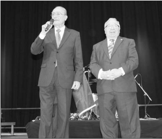
Intervención del alcalde, Francisco de la Torre.