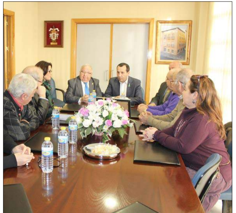
Un instante del encuentro mantenido en la sala de juntas.