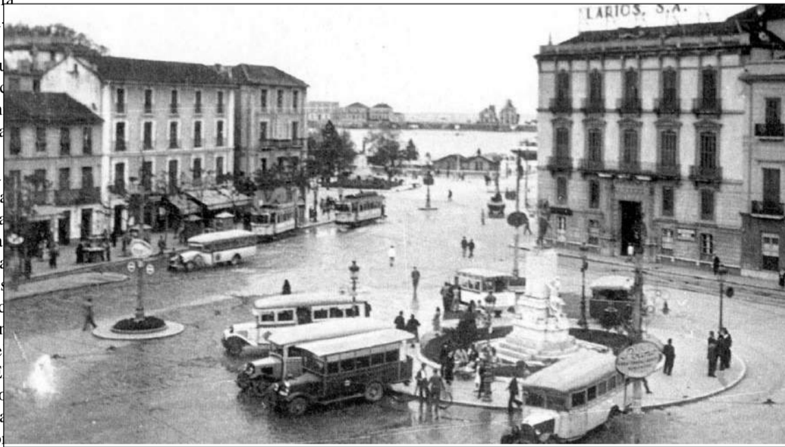
Tranvías y autobuses en la Plaza de la Marina. Málaga 1927.

Hilarión de la Verbena de la Paloma, hoy las ciencias adelantan que es una barbaridad, el de noviembre de 1906, se inauguró en Málaga el tranvía eléctrico. Una caravana de seis vehículos de tracción eléctrica, a las cuatro y cuarto de la tarde, encaminaron hacia la barriada paleña, uno de ellos iba engalanado con ramajes, flores y las banderas de España y Bélgica recorriendo el trayecto desde la Alameda a las cocheras situadas a la entrada de la barriada de Palo en veinte minutos, según informaba al día siguiente el periódico local El Popular. El trayecto finalizaba en el edificio de oficinas que la compañía tenía en el espacio que posteriormente serían las Cocheras de