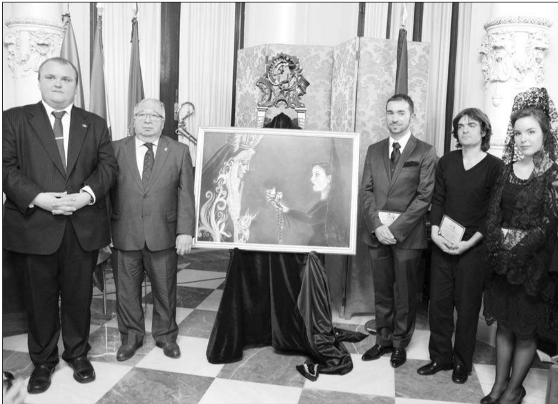
Acto de presentación, con el presidente de la Federación de Peñas.