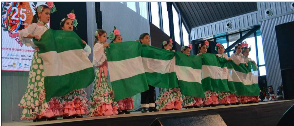
Pequeñas mostrando la bandera andaluza.