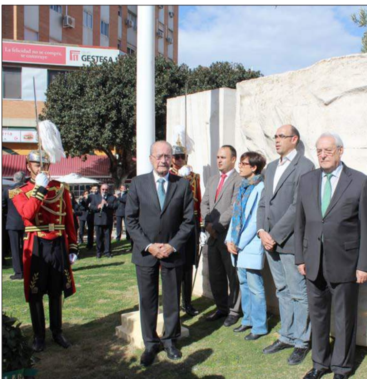
Interpretación del himno de Andalucía con la Banda Municipal.