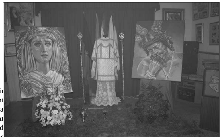
Escenario preparado para el pregón.