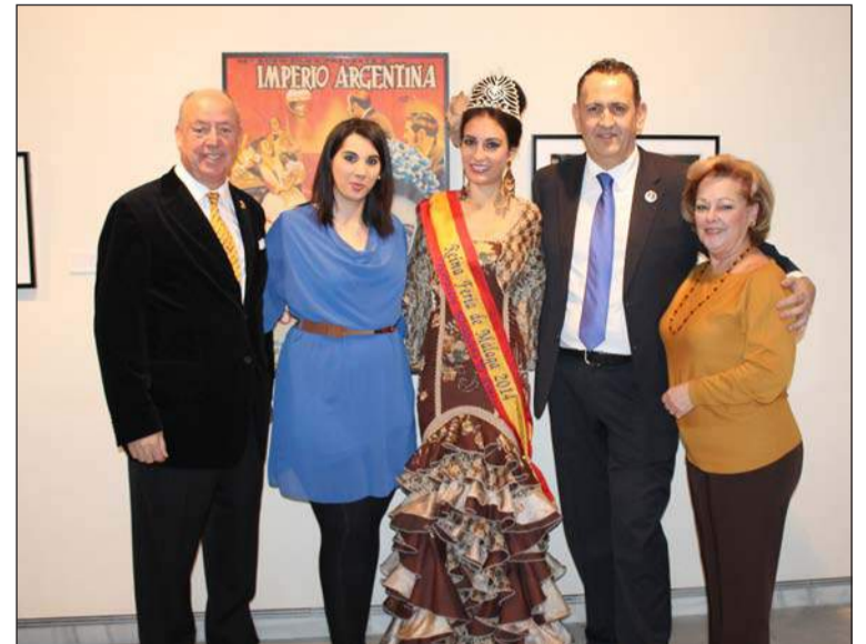
Representantes de la Federación de Peñas, con la Reina de la Feria 2014.

de esta artista universal, así como también todas las facetas de su vida: desde sus películas, música y espectáculos, hasta los éxitos que cosechó en Nueva York, París o Berlín. De igual forma, la muestra invita a los visitantes a acercarse a su faceta personal más íntima y entrañable, que encontró su remanso de paz en Benalmádena, donde tuvo su domicilio durante más de 30 años; a la mujer de vida intensa que se adelantó a su época; a la madre que sobrevivió a sus dos hijos; a la estrella que se codeaba con lo más granado del mundo artístico y a la mujer admirada por todos. En definitiva, más de 120 objetos, 160 fotografías, 20 películas y un centenar de documentos confor-