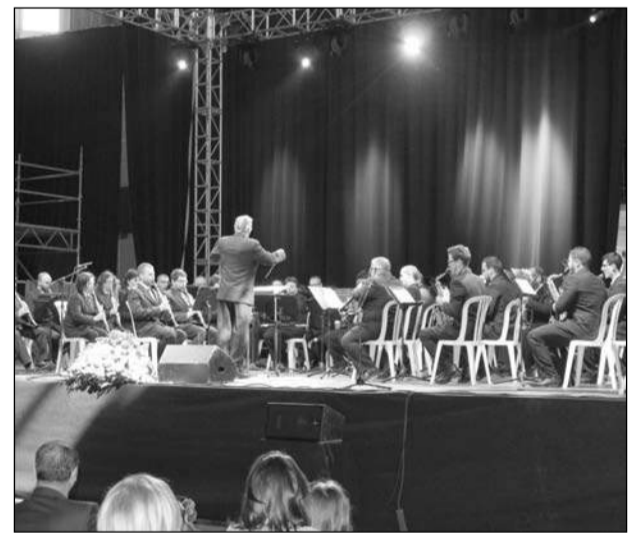
Concierto de la Banda Municipal de Málaga.