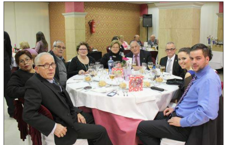
Socios y simpatizantes de la entidad disfrutando de la actividad.