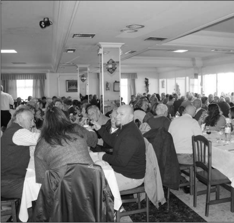
Un gran número de socios se dieron cita en esta actividad.