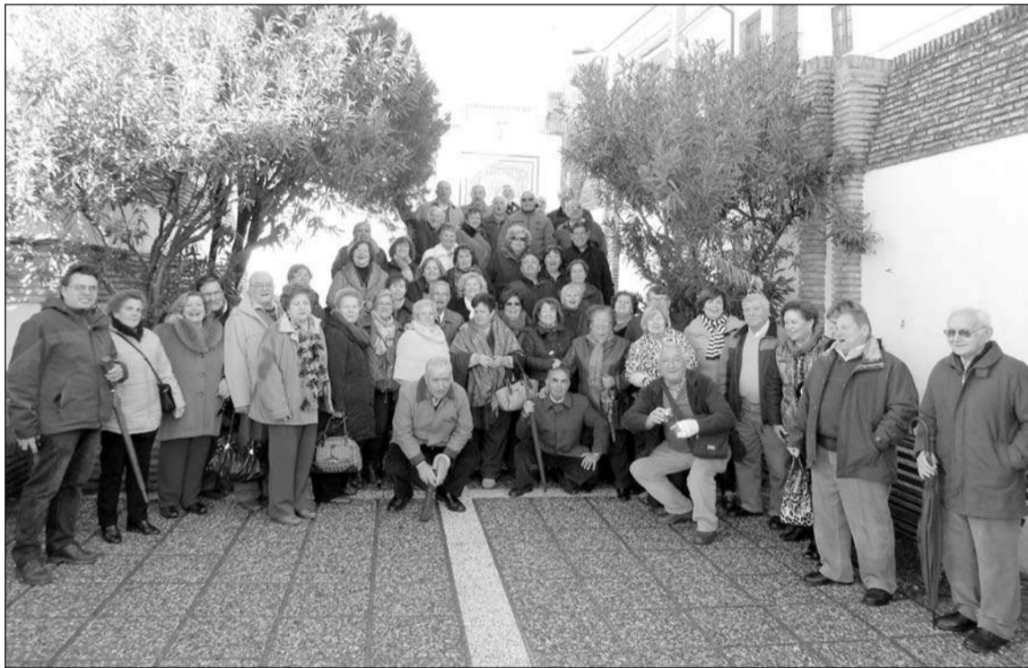
Socios de la entidad desplazados a Puente Genil.

Abiertas de sus Corporaciones Santa andaluza presenta innu- Bíblicas, próximas ya las fechas merables y genuinas caracterís- cualesmales. ticas, basadas en historia y sujetas a la autoridad eclesiásti- Allí el Presidente de la Agruveces en leyendas, pero esteca ni pertenecientes a las Cofrada de las Corporaciones, pueblo andaluz y cordobés, días. interesantísima que confir- man las muchas y variadas tra- ración Malagueña de Peñas, Granados, dio la bienvenida alPuente Genil, situado a orillas Así pues, la originalidad quediciones que encierran todos y Centros Culturales y Casas numeroso grupo de socios allídel río Genil que lo cruza y presenta la Semana Santa encada uno de los pueblos de Regionales 'La Alcazaba', tras- desplazados al que con su juntaña, ha sabido dar a la comPueblo Genil reside en la preuestra Comunidad Autónoma pasó en esta ocasión las fronteirectiva acompañó en toda lamoración de su Semana Santasasencia de numerosas (más dede Andalucía. ras provinciales para desplazar-jornada con toda clase de expliana indiscutible y preciada per- se a la de la hermana Córdobaaciones en los diferentes Cuar-sonalidad, imprimiéndole un más concretamente a la locali-tes y con una amabilidadsello particular que viene dado dad de Puente Genil con ocaexquisita. por la presencia de figuras sión de la Jornada de Puertas Sabido es que la Semanabíblicas en las procesiones y