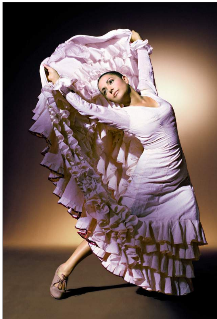
La bailaora Eva La Yerbabuena.

Las entradas pueden adquirirse en las taquillas de cada espectáculo que abrirán dos horas antes del comienzo del mismo. También a través de www.mientrada.net .