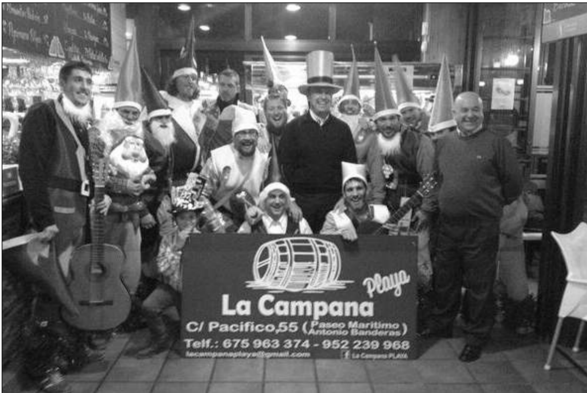
Se vivió una gran velada carnalera en La Campana Playa.