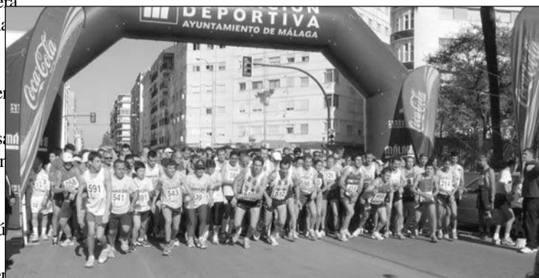
Imagen de archivo de la prueba.

... para disfrutar de pensión completa... ... una copa de bienvenida y música en vivo para festejar el día de San Valentín en compañía de otros compañeros de esta entidad. El domingo 22, por su parte, habrá almuerzo de hermandad, mientras que el 28 de febrero, en Andalucía, se realizará una fiesta para niños y mayores a partir de las 13 horas.