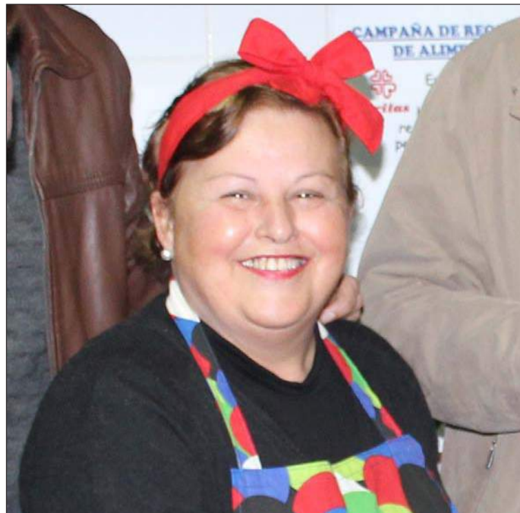
La presidenta, durante la pasada Berza Carnavalesca.

M.C.C.- Nosotros contamos con ella para todos, igual que la Federación puede contar con la