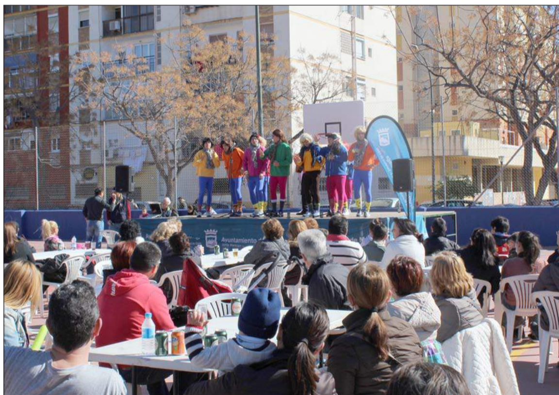
Ambiente carnavalesco en la barriada El Torcal.

Continuando con la completa agenda del próximo mes, el sábado 21 se celebrará un Concurso Gastronómico que tendrá al pollo como ingrediente principal; mientras que el mes concluirá con un arroz por el Día de Andalucía, con la actuación de diferentes grupos del carnaval malagueño.