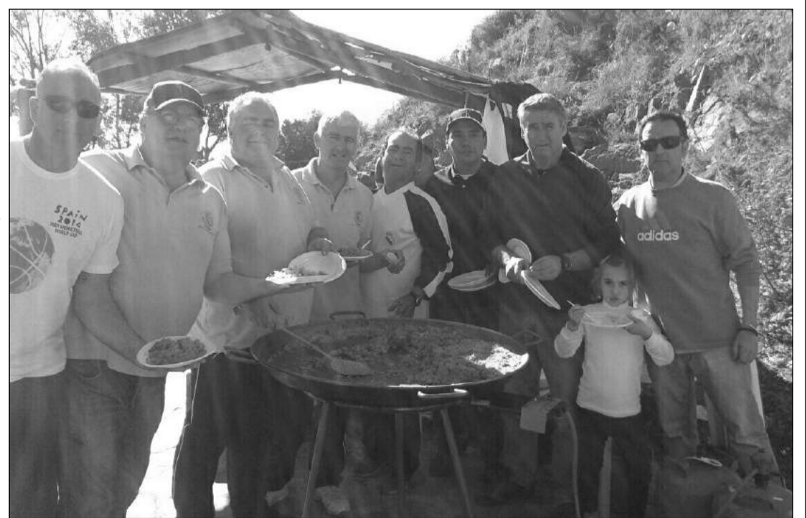
La Peña Madridista El Palo participaba el pasado 25 de enero en la Romería de San Antón, una de las festividades más tradicionales de su barriada en la que realizaron un arroz para ser degusta- do por todos los socios asistentes.