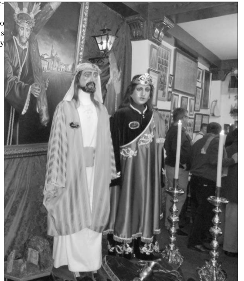
Muestra de las figuras bíblicas que componen la Semana Santa de Puente Genil.

En su conjunto fue una jorna- man las muchas y variadas tra- ciones que encierran todos y de los pueblos de Comunidad Autónoma de Andalucía.