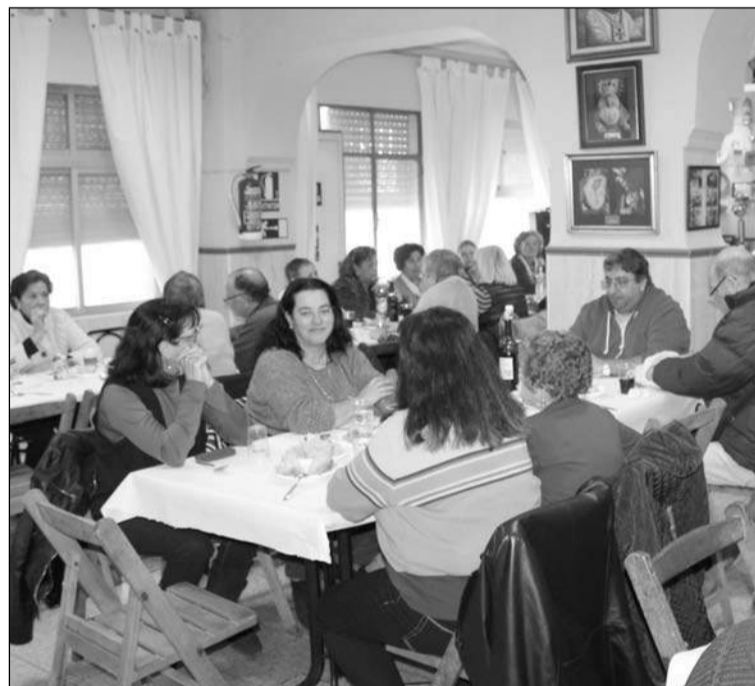
Salón de la Peña San Vicente durante el almuerzo.