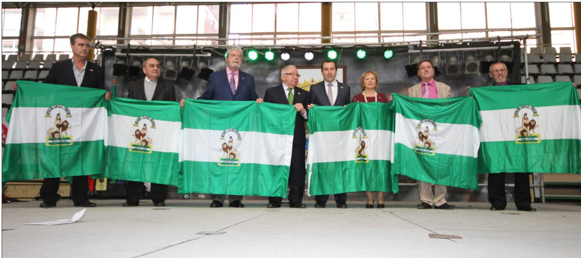
Entrega de banderas andaluzas el pasado año en el Pabellón de Carranque.

El cantante de Nerja actuará en el Palacio de Ferias y Congresos, en un acto en el que se pronunciará el tradicional pregón