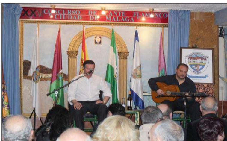
Uno de los cantaores finalistas.