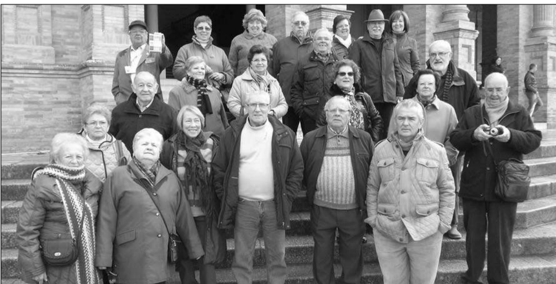
Un grupo de socios durante la excursión.