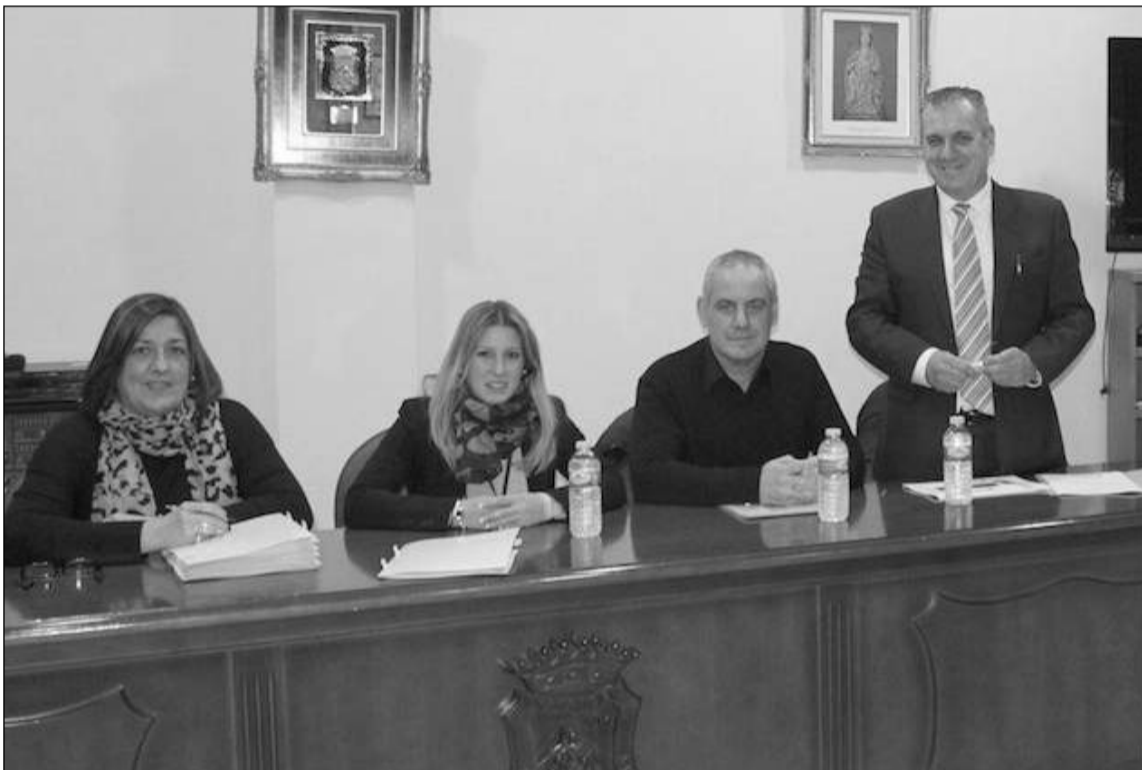
Imagen del curso de obligaciones fiscales impartido por profesionales de TAX.