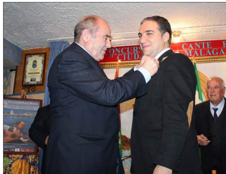
Imposición del Escudo de Oro al presidente de la Diputación.