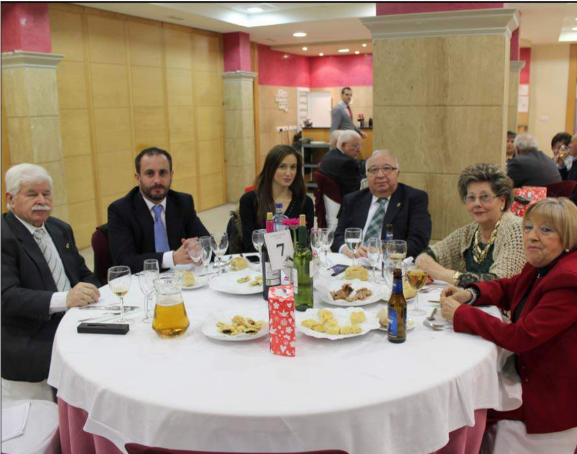
Mesa presidencial durante la cena del pasado sábado.