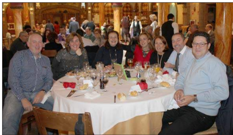
Miembros de la junta directiva de la Peña Costa del Sol.