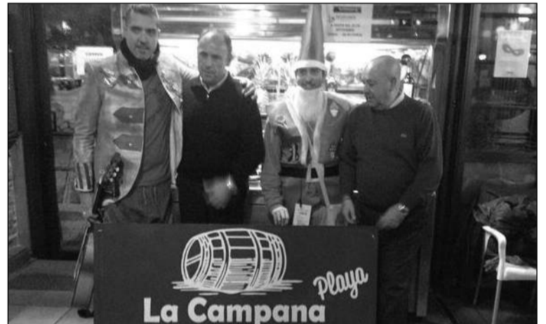
Carnaleros con el presidente de la asociación y el vicepresidente de la Federación.