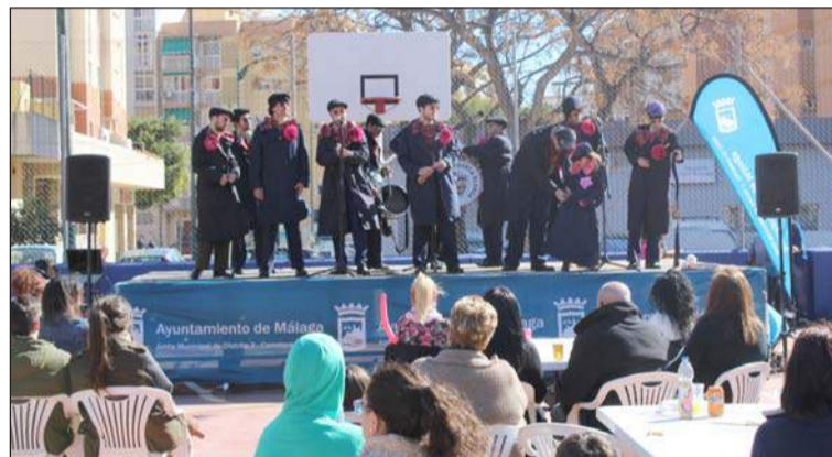
Uno de los grupos actuantes.