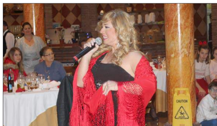
Un instante del concierto de Lidia Gómez.