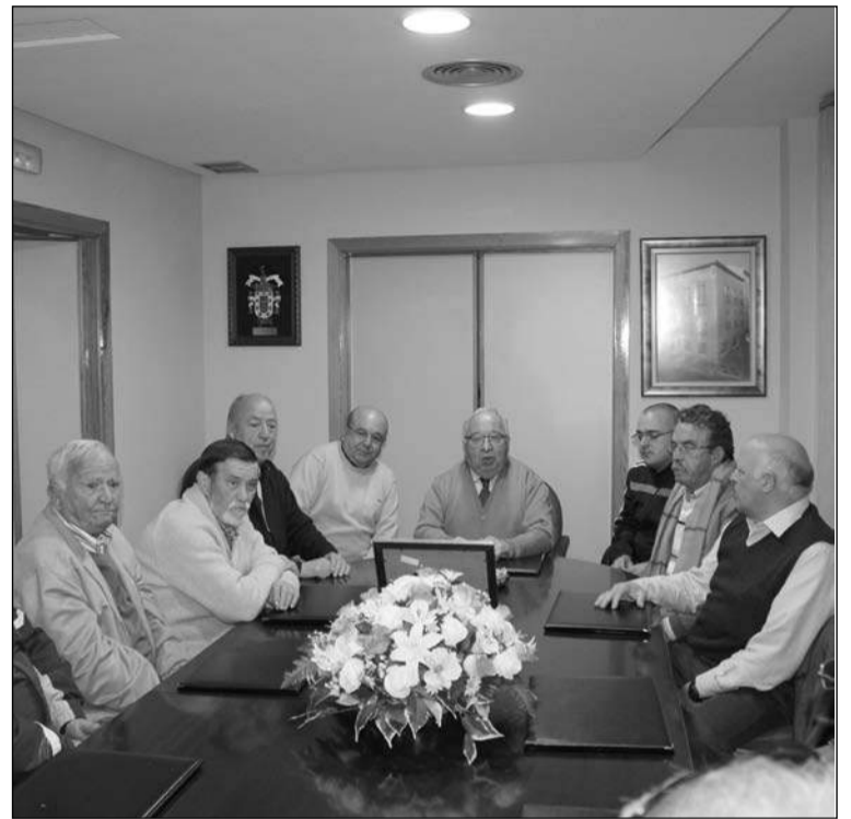
Recibimiento en la sala de juntas de la Federación.

El conjunto malagueño se reunió con los jugadores de liga de Málaga y proclamándose campeones de España por el importante logro obtenido en la vigésima edición de esta competición que se celebraba en la sala de juntas de la Federación Malagueña en el campeonato de estado.