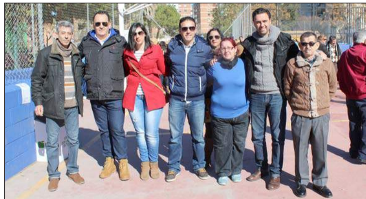
Peñistas, autoridades municipales y representantes de la Federación.

Entidades colaboradoras con esta publicación: