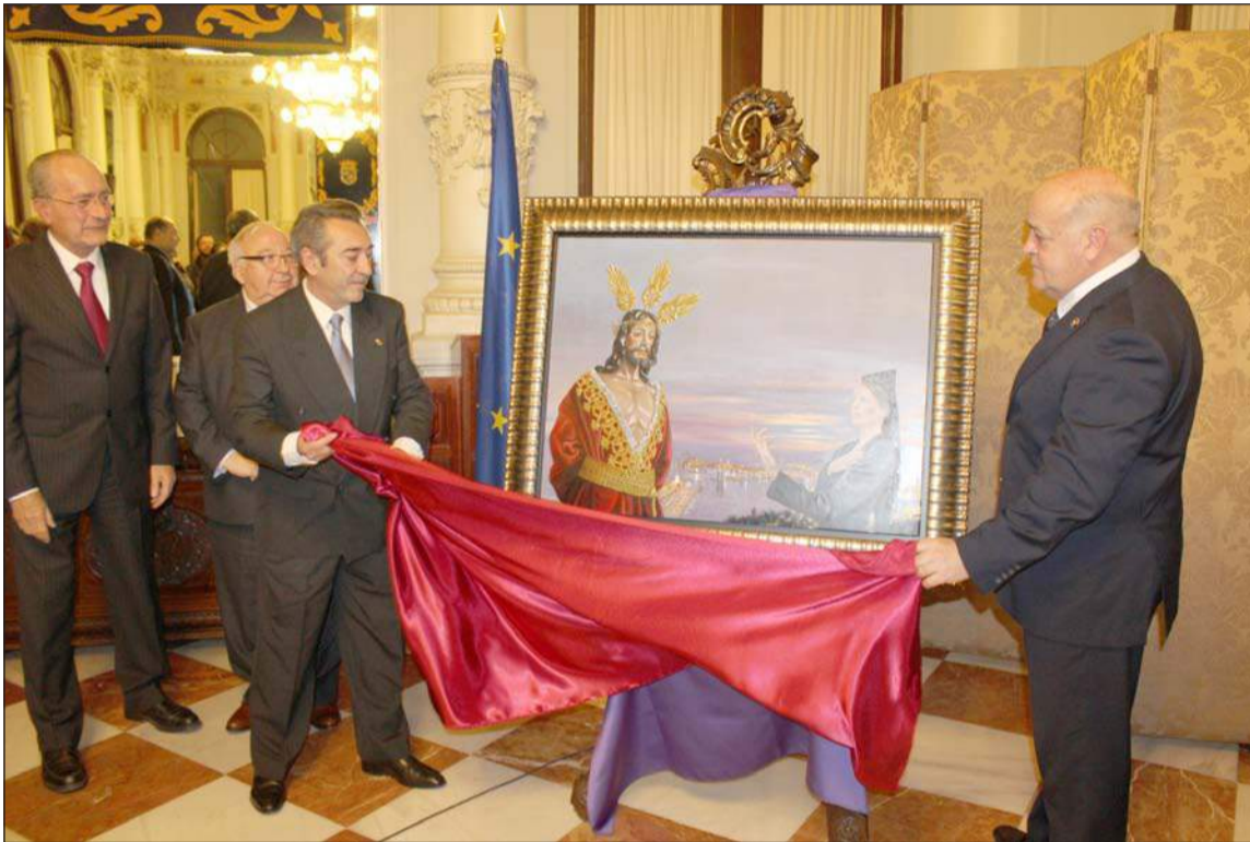
Instante en el que se opade a descubrir el cartel del concurso.