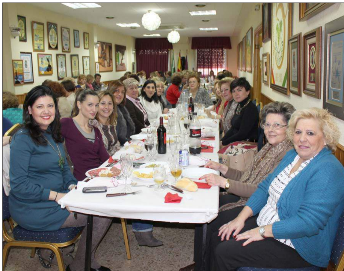
Mesa de las organizadoras con las concejales y otras componentes de la Federación de Peñas.

Hay cosas que son exclusivamente malagueñas