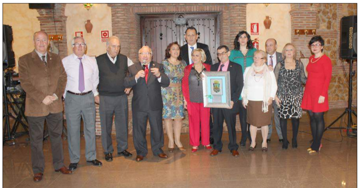
Directivos de la Federación y peñistas de distintas entidades con el homenajeado.