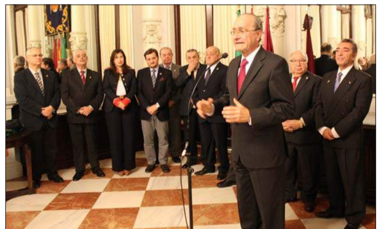
Intervención del alcalde, Francisco de la Torre.

Para los ganadores en esa jornada aún restará una fecha muy importante, la del 28 de marzo, cuando puedan cantar en la Misa de Alba a Jesús Cautivo y la Virgen de la Trinidad. A continuación, se celebrará un almuerzo en la sede, donde se entregarán los premios.