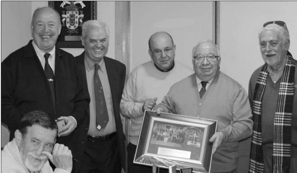
Recuerdo a la Federación entregado por el equipo de la Peña La Rosaleda.