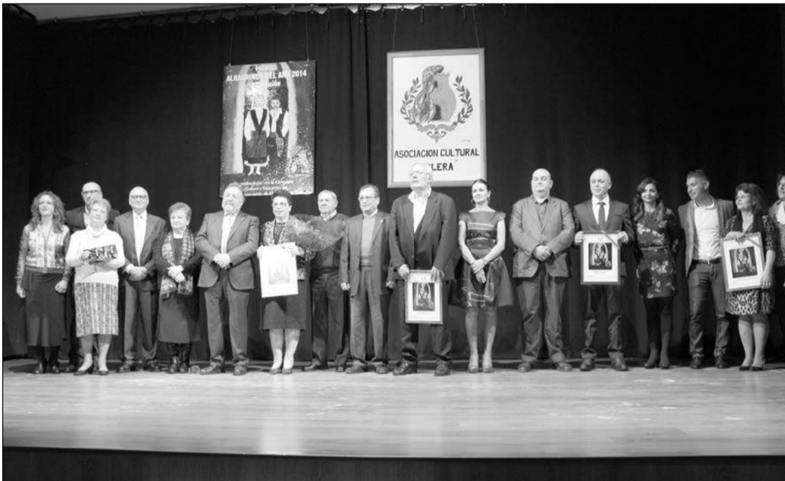
Galardonados en el acto con autoridades presentes.