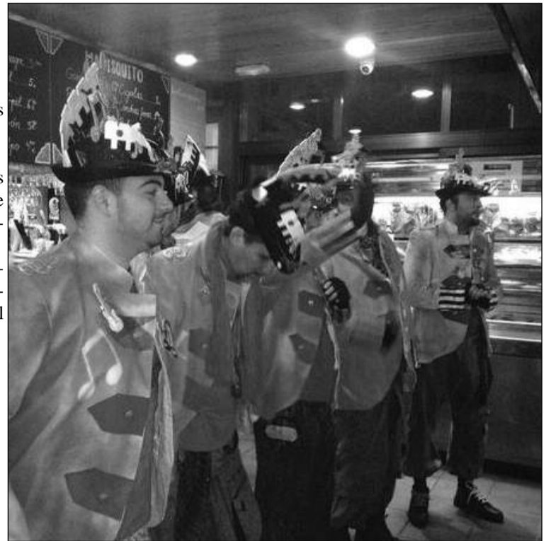
Actuación de un grupo de carnaval.