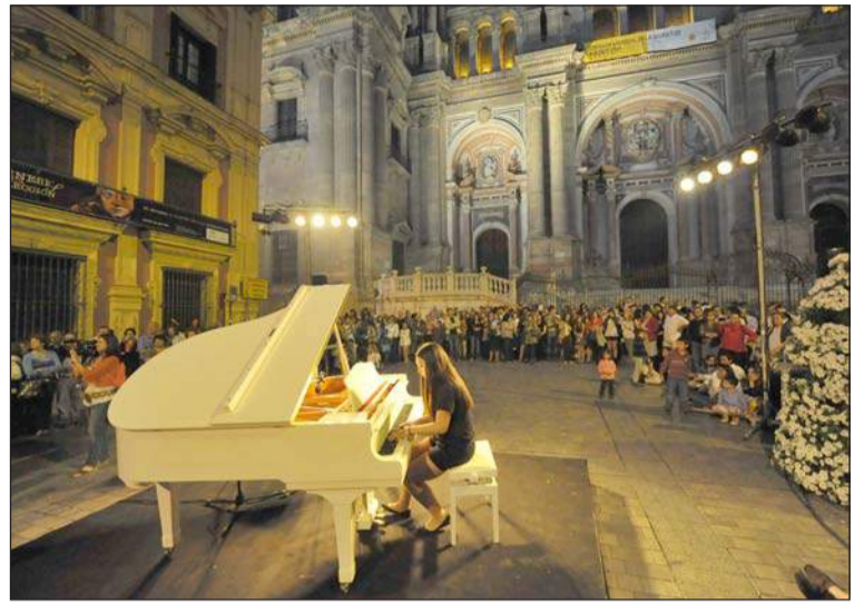
Imagen de archivo de una edición anterior de la Noche en Blanco.

puestas salgan adelante. En la séptima edición, se estimó que esta implicación directa fue de aproximadamente 3.500 personas. Este espíritu colaborador fue posible en 2014 a través del trabajo de más de 180 entidades, entre instituciones públicas y privadas, asociaciones, colectivos y establecimientos comerciales.