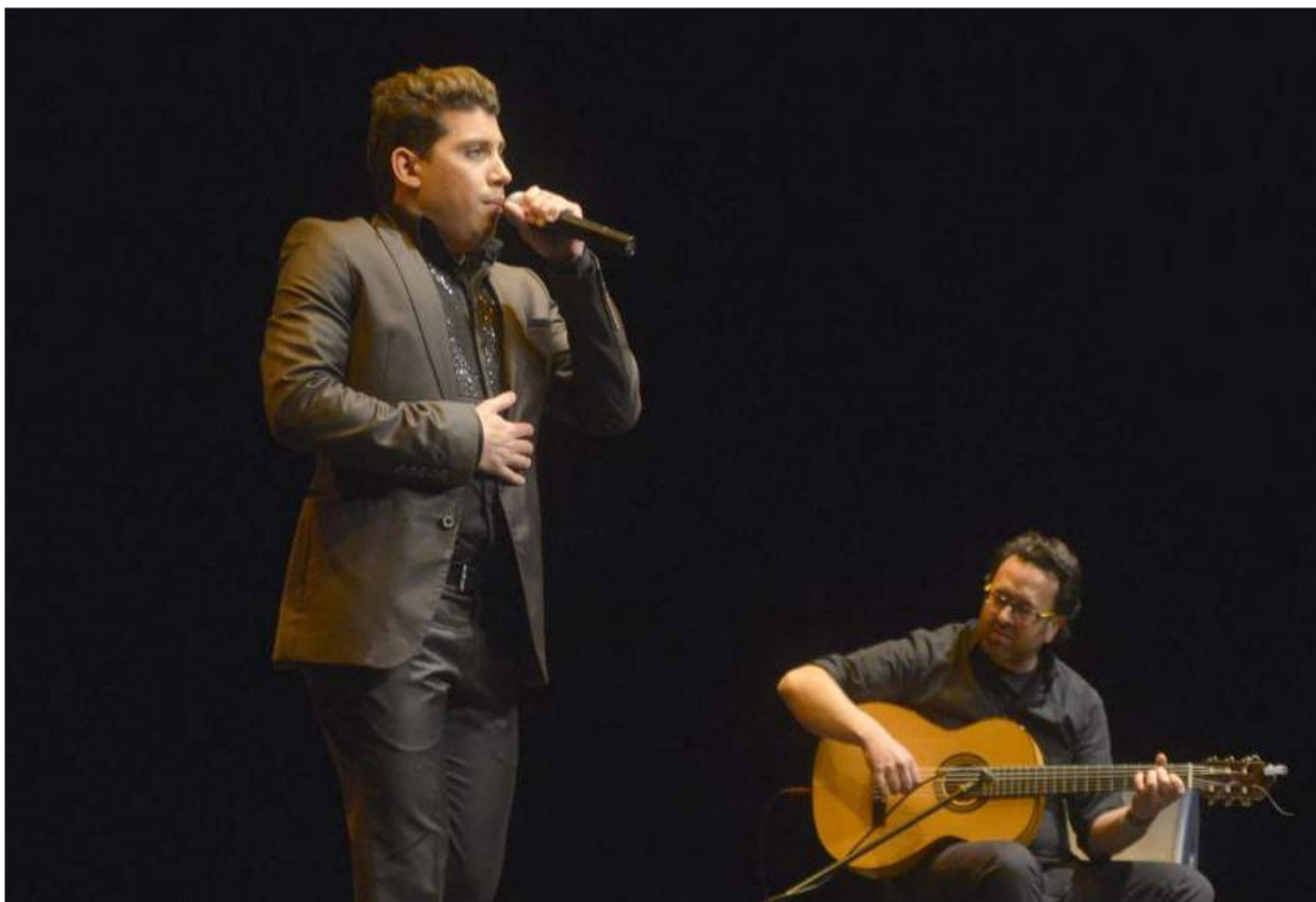
El cantante Antonio Orozco, en una actuación en directo.