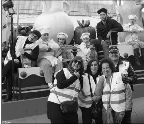
Voluntarios y miembros de seguridad ante la carroza de Ratatouille.