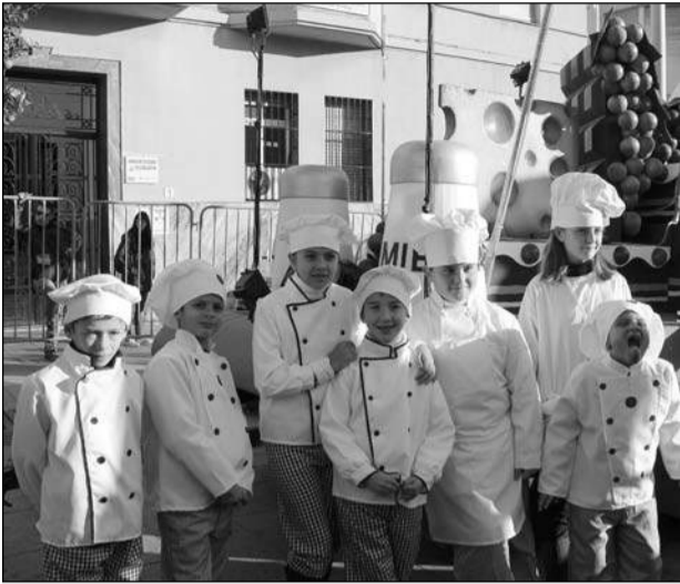
Niños que participaron en la carroza de la Federación.