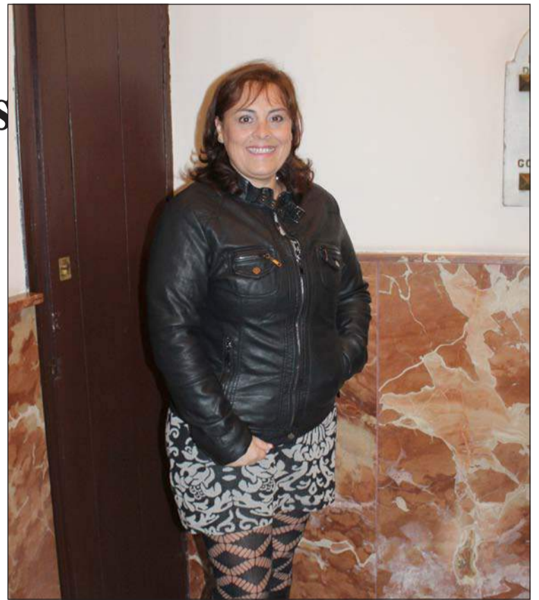
La presidenta, el pasado lunes en la misa del Rocío.