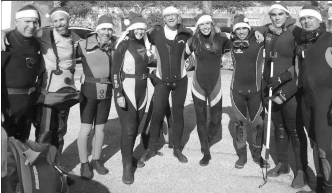
Participantes en la inmersión subacuática del pasado 28 de diciembre.