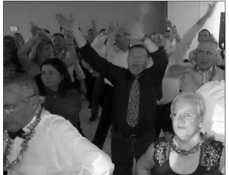
Socios de la entidad disfrutaban de la Nochevieja.

el día 3 de enero. Aclamados y su llegada por la chiquillería allí convocada, y una vez vista el Nacimiento, regalaron una cantidad de juguetes y chuchetas que hicieron las delicias de los niños y peques. No duró mucho la visita regia debido, como es sabido, a los múltiples compromisos