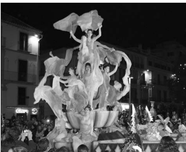
Una de las formaciones más espectaculares de la cabalgata.