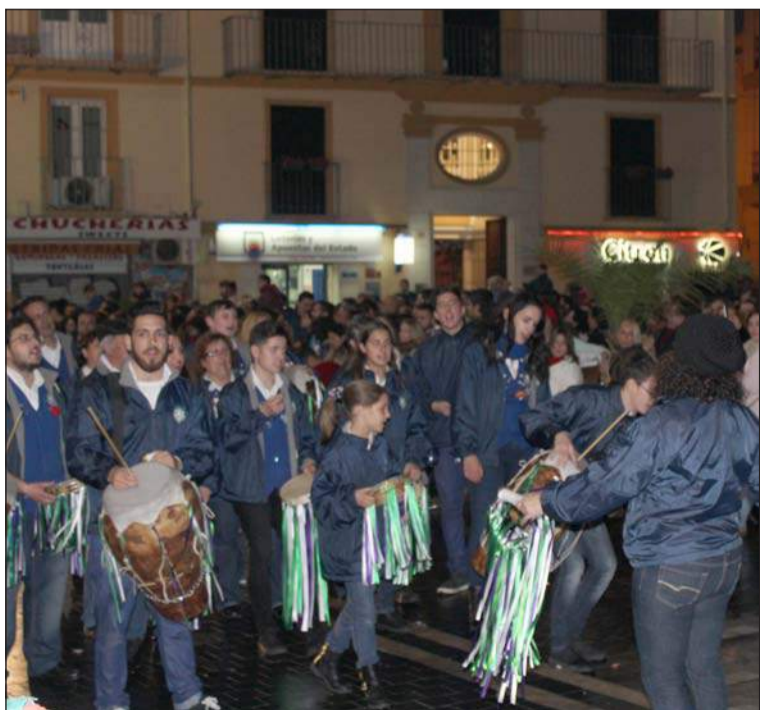
Pastoral de la Peña Finca La Palma por la plaza de la Merced.