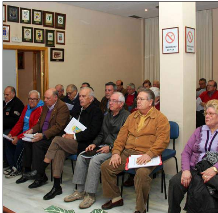
Imagen de archivo de la asamblea del pasado año.

Dada la importancia de los temas a tratar, se ruega todos los convocados hagan todo lo posible por asistir a esta Asamblea General Ordinaria de la Federación.