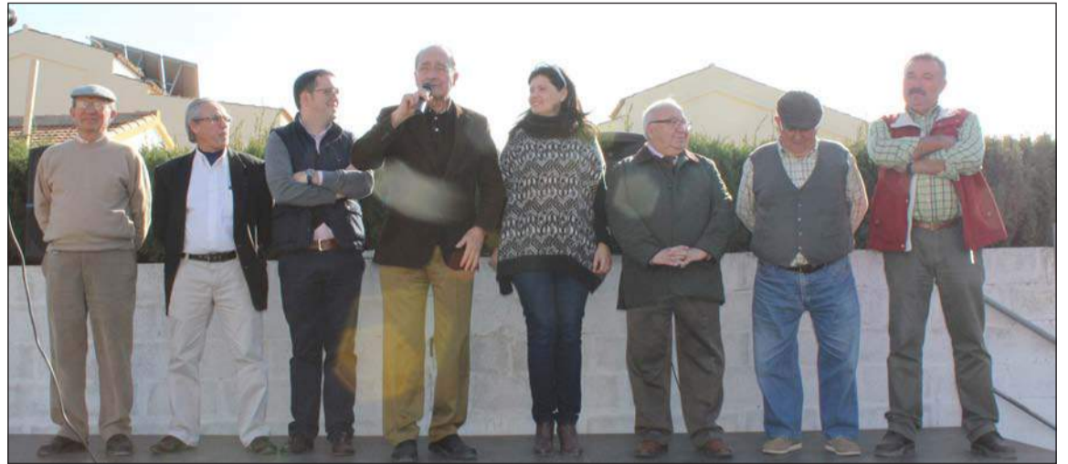
Intervención del alcalde, Francisco de la Torre.

Además, numerosos vecinos, malagueños en general y componentes de otras peñas de nuestra capital se volvieron a dar cita en esta actividad tan entrañable que estuvo acompañada por diversas actuaciones, y en la que se vivió una agradable jornada casi campera, en pleno casco urbano, y con un tiempo extraordinario.