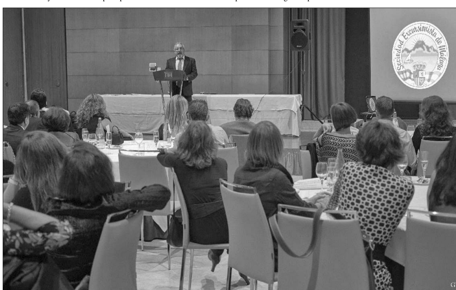
Intervención del presidente en la cena de navidad.

bueno ofreció un pequeño discurso con las intenciones de la sociedad y objetivos para el año siguiente.