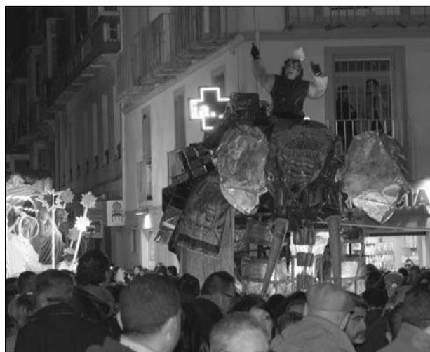
Un gran elefante haciendo su entrada en la plaza de la Merced.