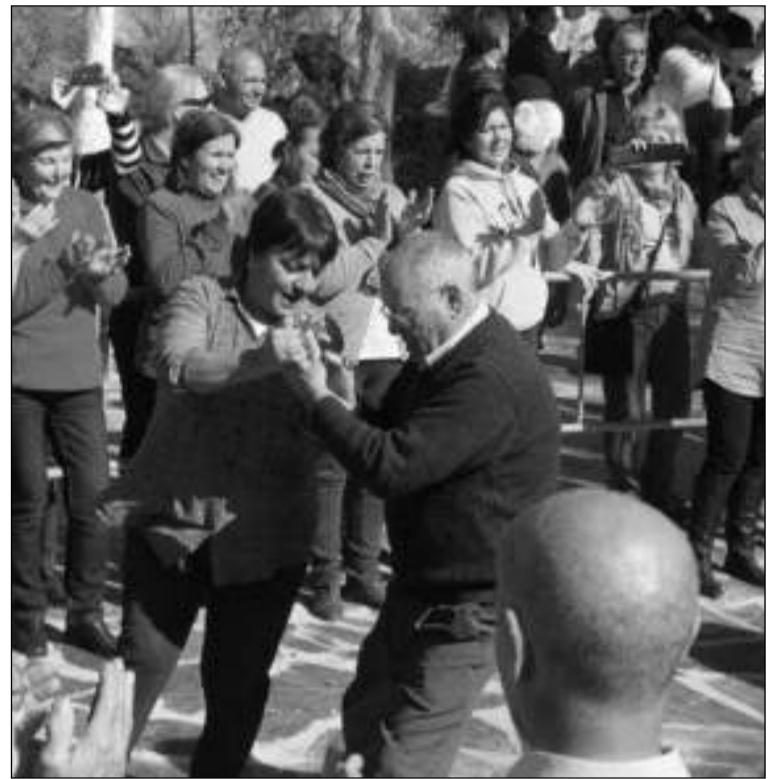
Recuperación del baile de Maragatas.

Federación Malagueña de Peñas, Centros Culturales y Casas Regionales 'La Alcazaba' como son la Peña El Palustre, la Peña Malaguista de El Palo, la Peña Madridista de El Palo, la Peña Barcelonista de El Palo, la Peña