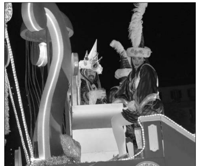
El Rey Gaspar en su trono real.