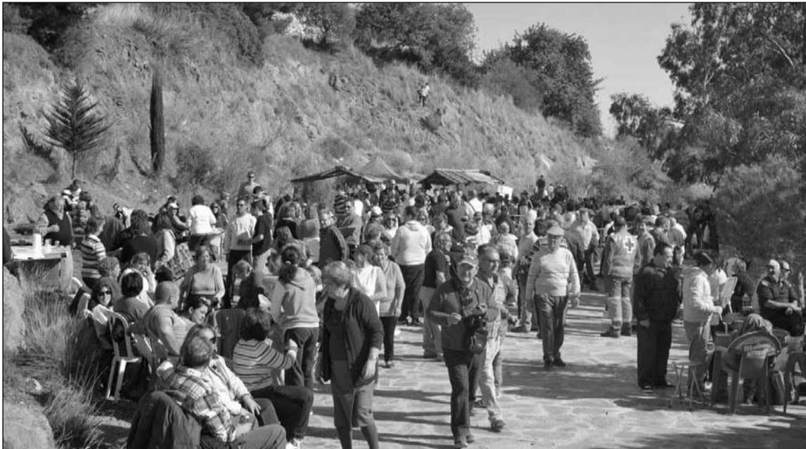
Vista de la romería del pasado año.