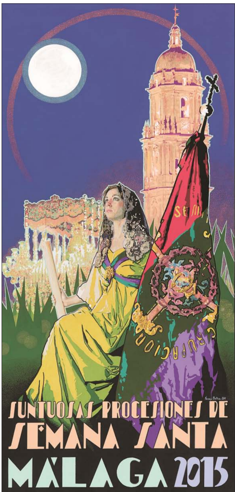
Cartel de la Semana Santa de Málaga 2015

La pieza es una pintura realizada sobre tabla de 180 cm de alto por 85 de ancho, elaborada con técnicas mixtas, acrílico, tinta china, acuarela y lápiz de color que trata de fundir diferentes estilos como el costumbrismo, el modernismo o el arte pop tan del gusto del autor, para con ellos conseguir un lenguaje más personal que pretende llevar a un lenguaje manual de la pintura de caballete las técnicas serigráficas de la cartelería clásica.