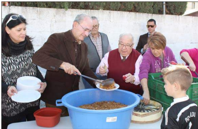
Reparto de la migas.