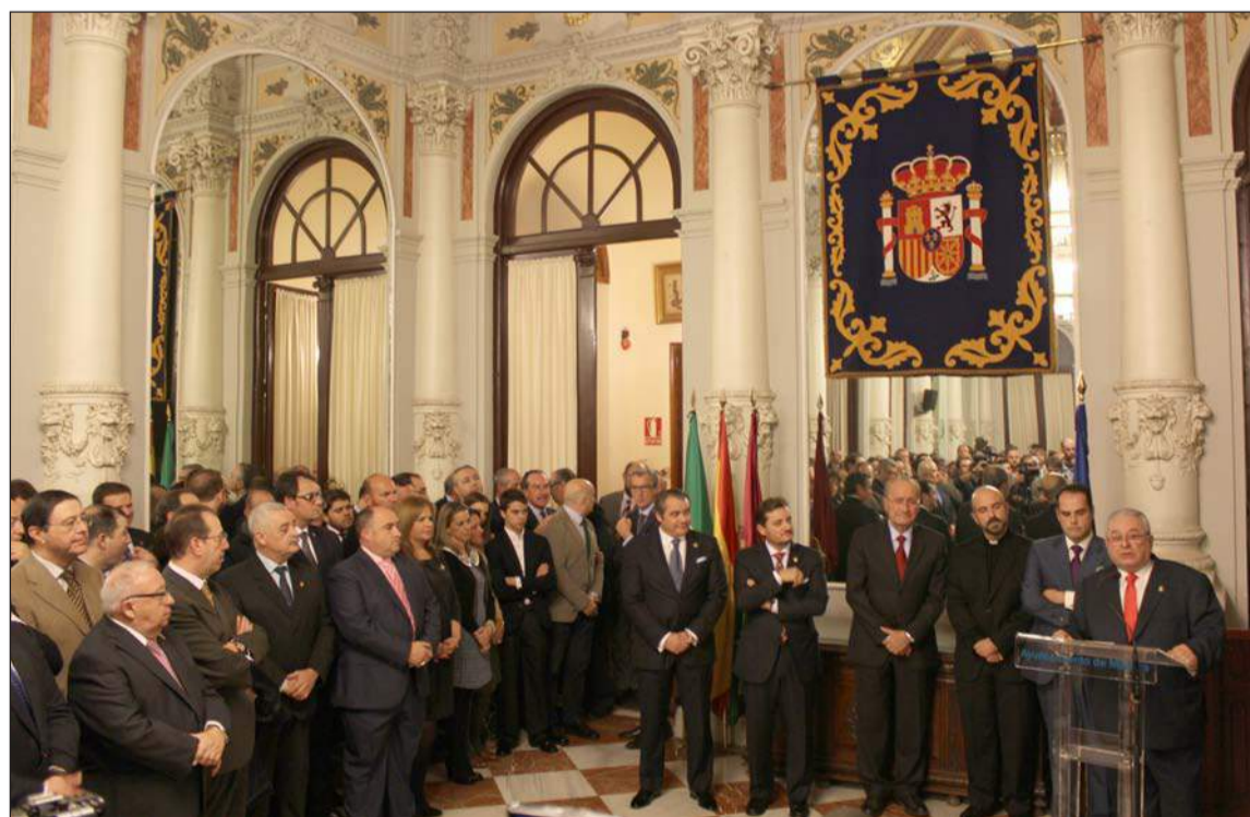
Imagen del Salón de los Espejos durante el acto de presentación del cartel.