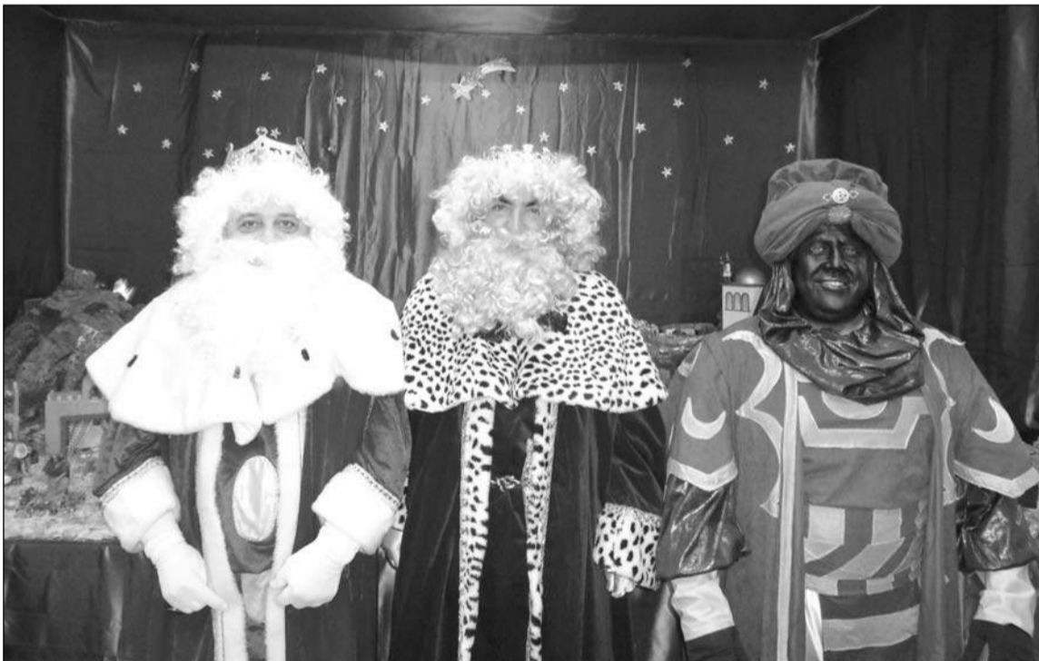
Los tres Reyes Magos, ante el Belén de la entidad.

Por unos momentos, malos trances y los escollos la situación actual de la entidad presenta y disfrutar de acontecimientos que la junta