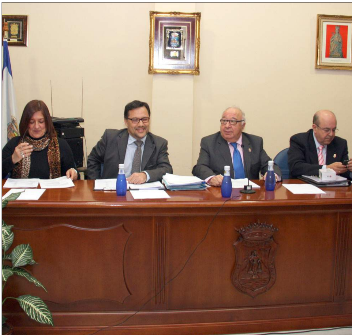
Asamblea de enero de 2014.