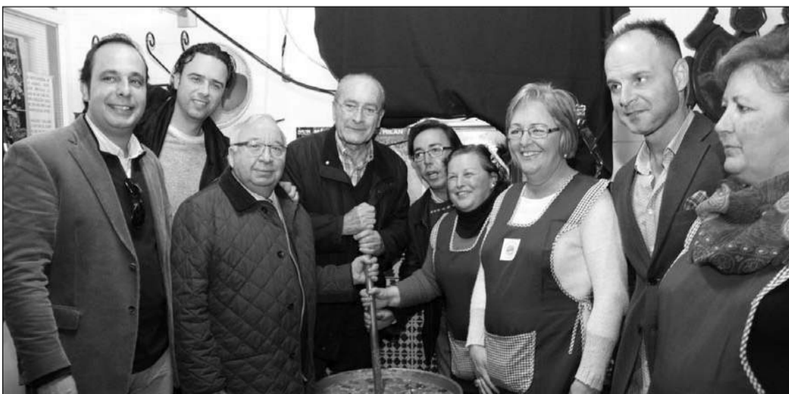
Preparativos de la Berza en su edición de 2014.