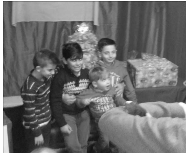
Ilusión de los niños con los Reyes Magos.