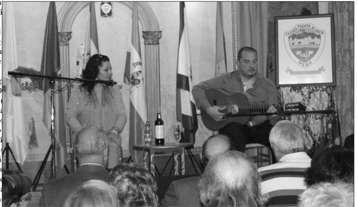
Una de las cantaoras que participaron en la primera de las semifinales.

Cada cantaor debió interpretar obligatoriamente tres cantes,