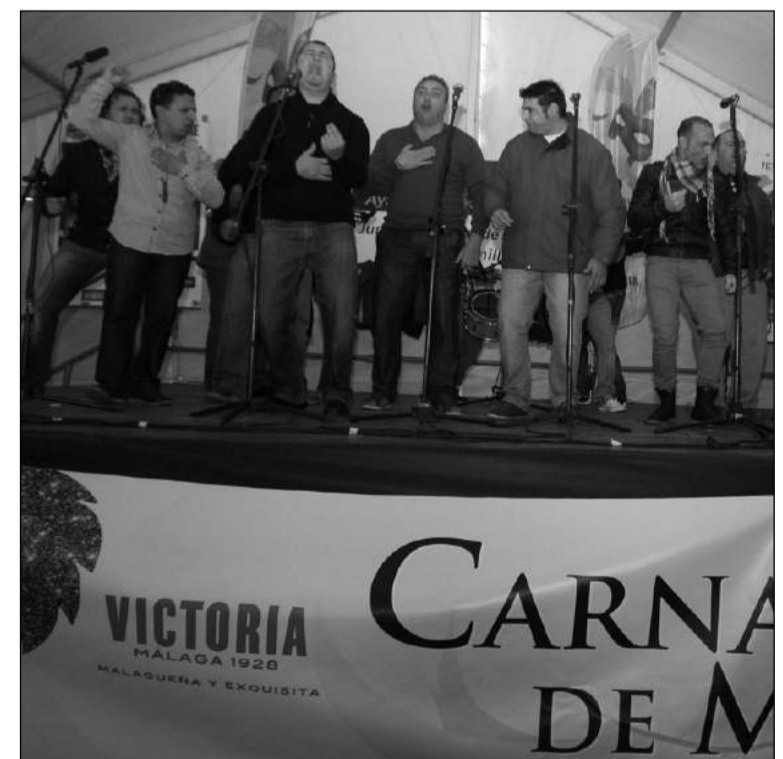
Imagen de archivo de una agrupación sobre el escenario.

La Peña Cortijo de Torre, una entidad perteneciente a la Federación Malagueña de Peñas, Centros Culturales y Casas Regionales 'La Alcazaba', se encuentra Así, una de las fiestas principales de esta fiesta, que tiene lugar desde hace muchos años muy les de las previas tiene lugar