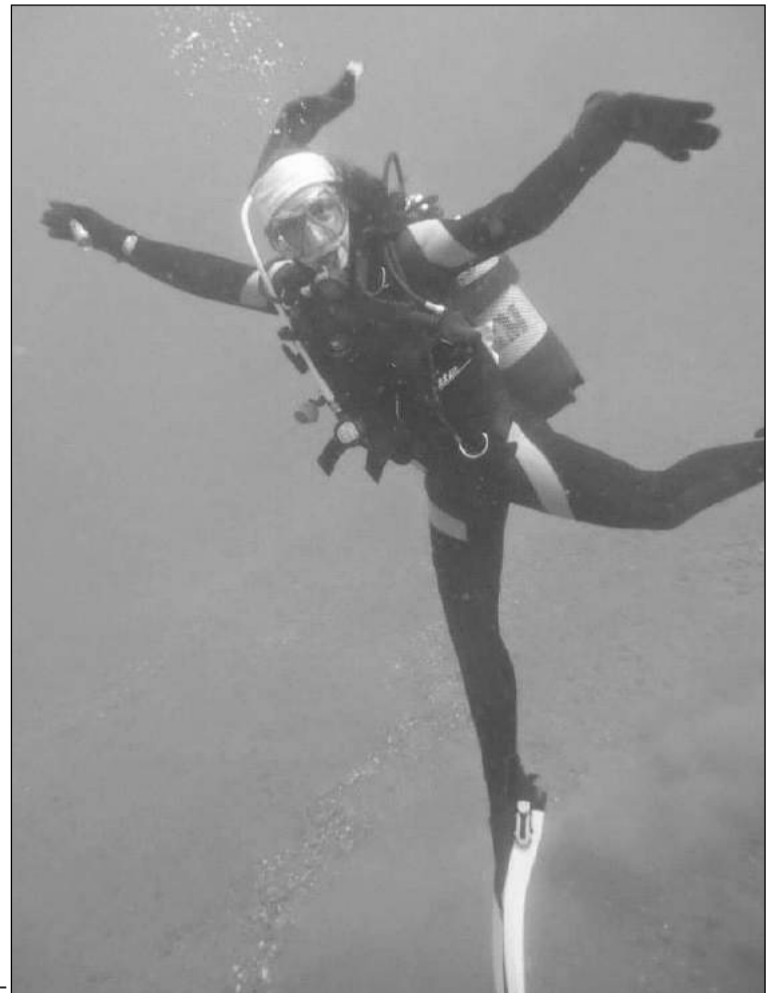
Divertida fotografía submarina.