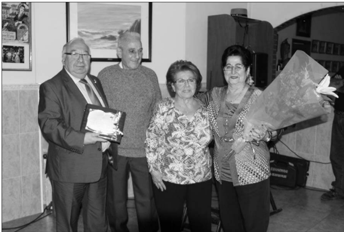
Entrega de un recuerdo al presidente saliente y a su esposa.