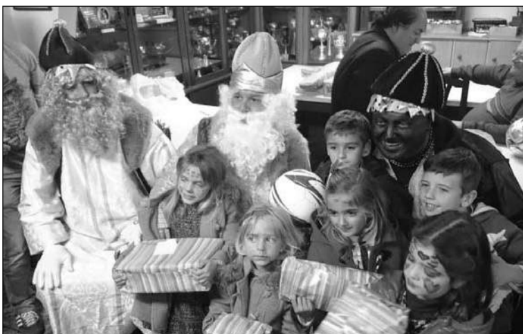
Algunos de los niños que recibieron los regalos de Sus Majestades.

Sus Majestades de Oriente fueron agasajados con el cariño de todos los niños asistentes.