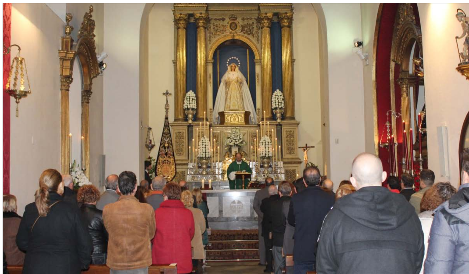
Un instante de la Misa oficiada en la parroquia de San Lázaro.

La Federación Malagueña de Peñas, Centros Culturales y Casas Regionales 'La Alcazaba' mantiene una estrecha vinculación con esta cofradía victoriana, con la que cada Lunes Santo colabora en su participación en la popular ofrenda floral 'Un Clavel