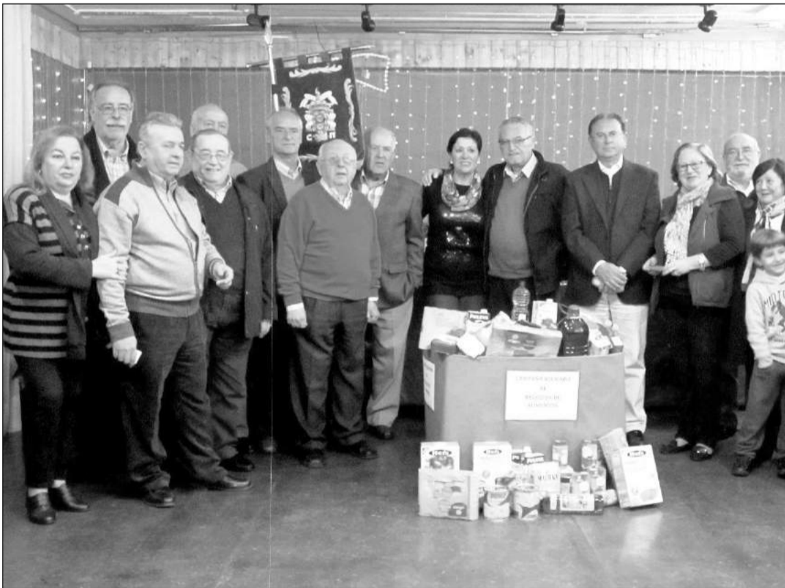
Socios de la Casa de Melilla y de la Asociación San Vicente de Paúl.