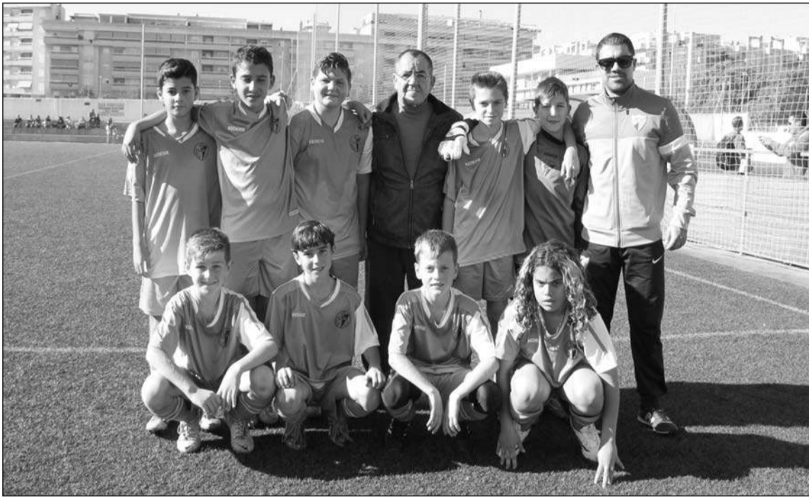
Uno de los equipos participantes del Atlético Portada Alta