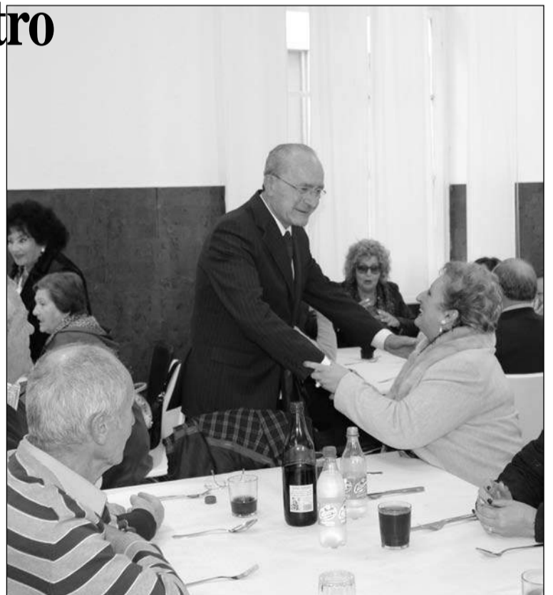
El alcalde saluda a los asistentes.