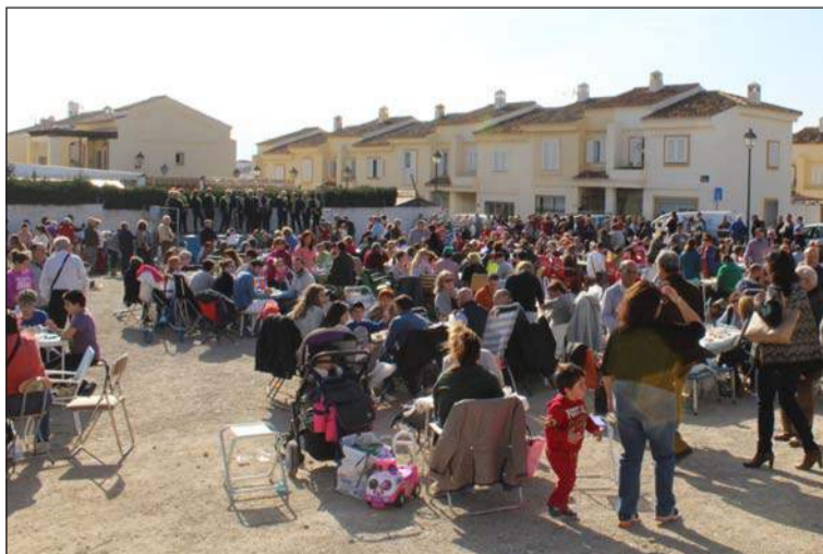
Numerosos socios se dieron cita en la actividad.