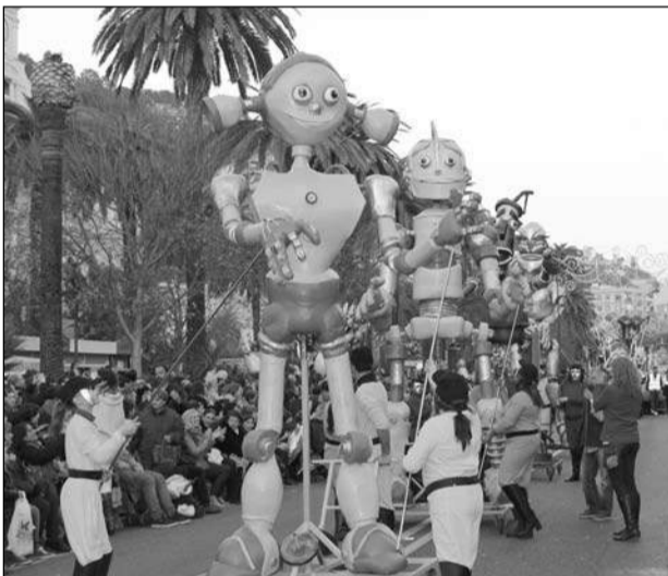
Uno de los pasacalles que formaban parte de la comitiva.