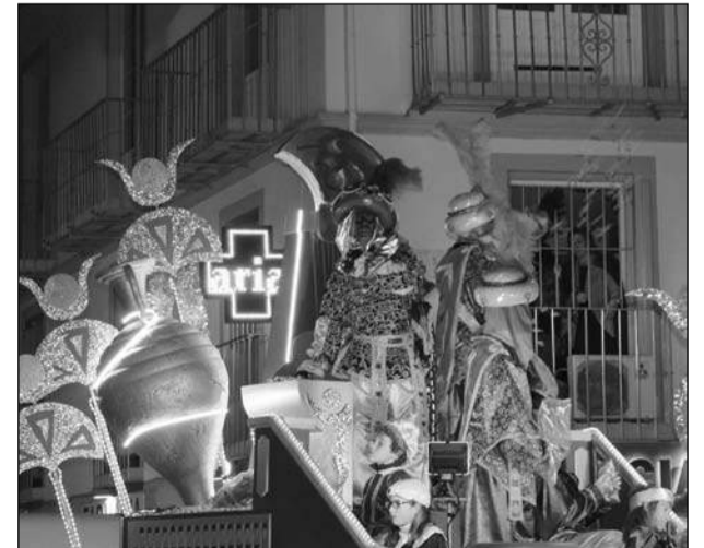
El Rey Baltasar lanza caramelos desde su carroza.