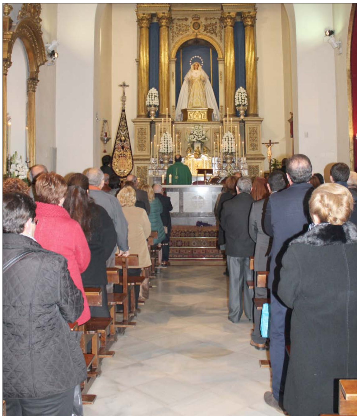
Rezo de la Salve a la Santísima Virgen.

para el Rocío'; así como dedicándole saetas cada Martes Santo a su paso por su sede, en la calle Victoria, cuando la procesión ya va de regreso a su Casa Hermandad durante su Estación de Penitencia.