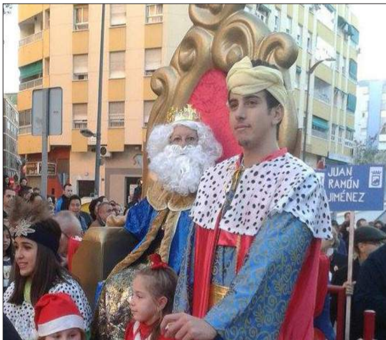
Melchor, como es tradicional, llegó de la Peña Los Ángeles.