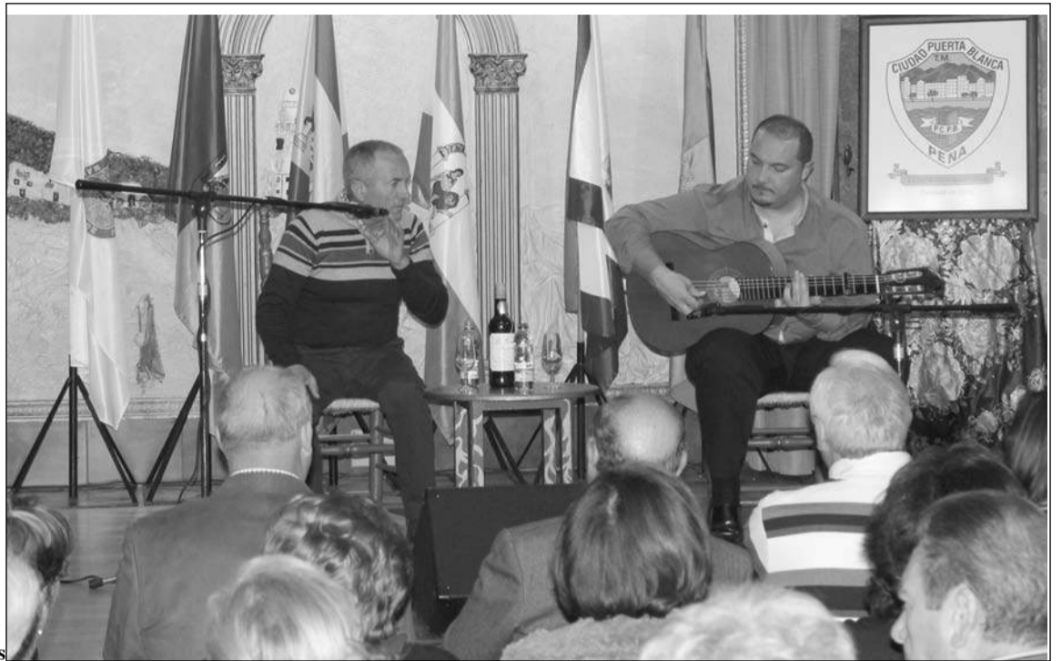
Uno de los cantaores encargados de abrir el concurso.