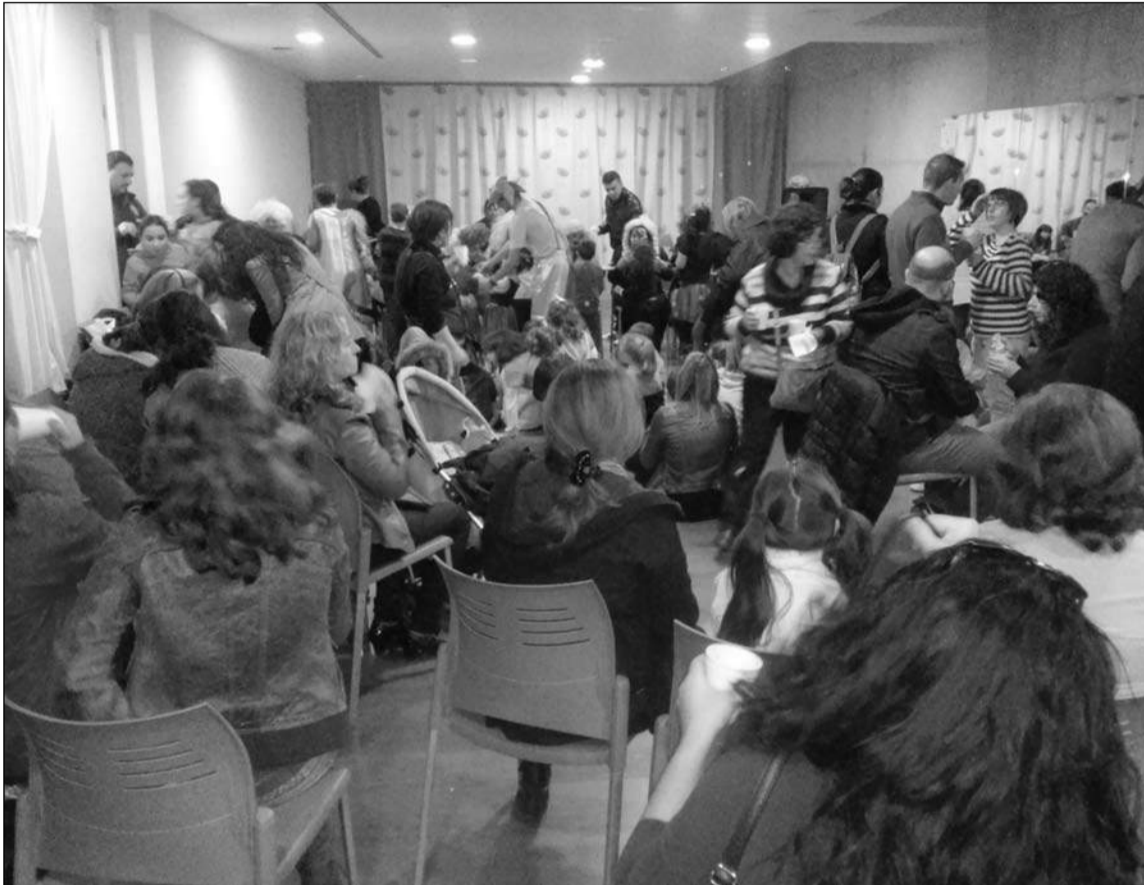
La sede se llenó de niños en la fiesta.

El acto, celebrado en la sede tarde inolvidable, sobre todo los de esta entidad perteneciente a más pequeños, que fueron los la Federación Malagueña de protagonistas del acto.