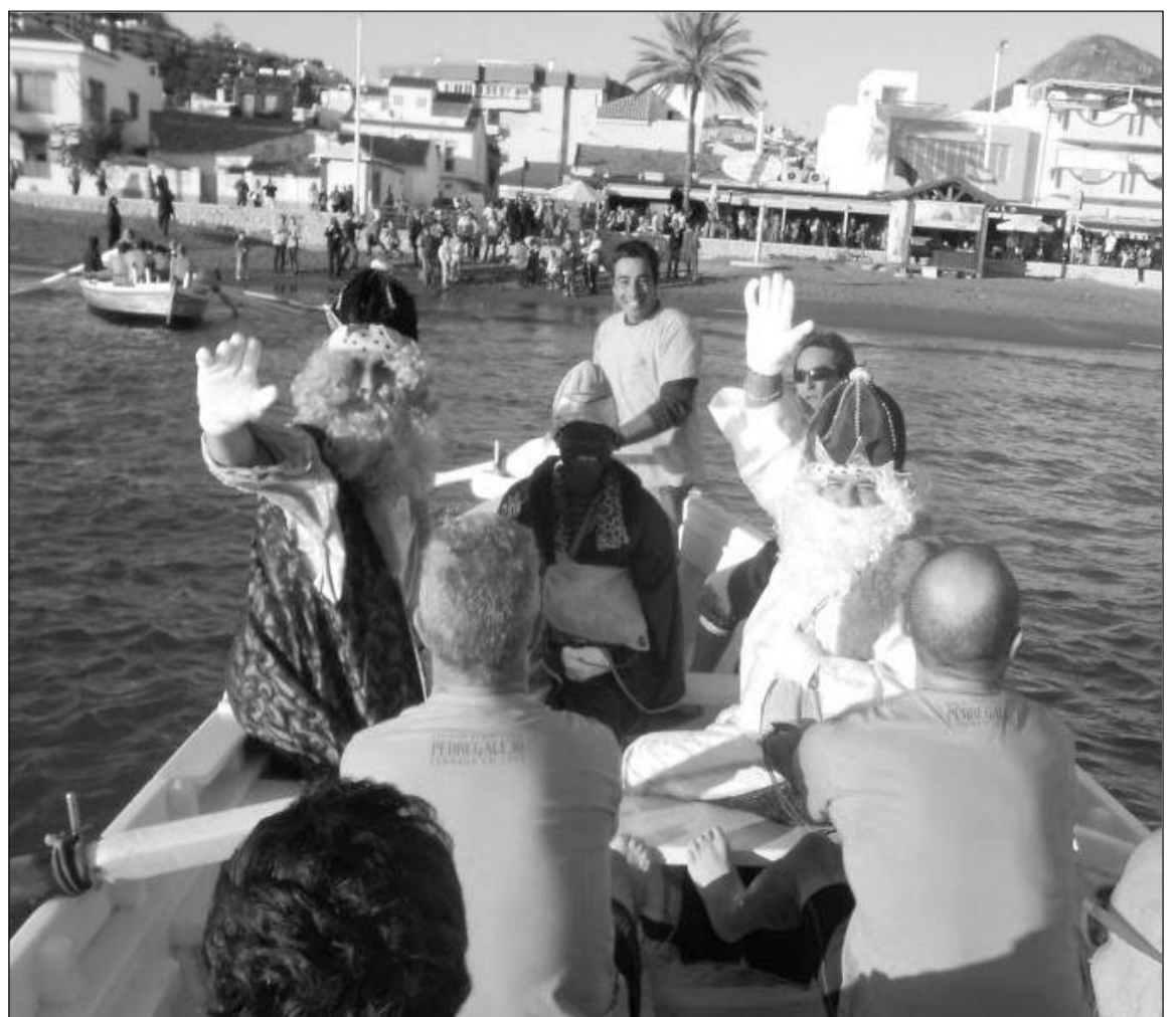
Llegada por mar de los Reyes Magos a la playa de Pedregalejo.