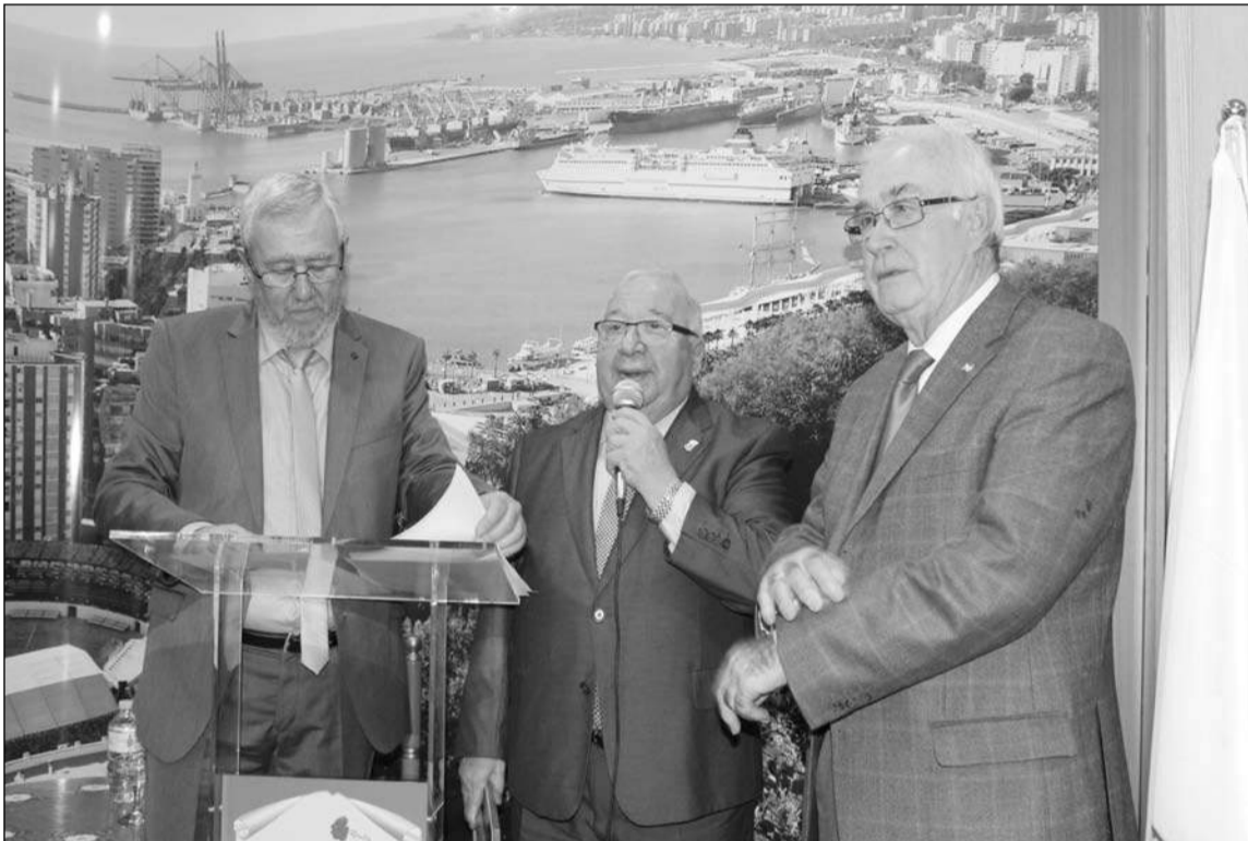
Intervención del presidente de la Federación, Miguel Carmona.