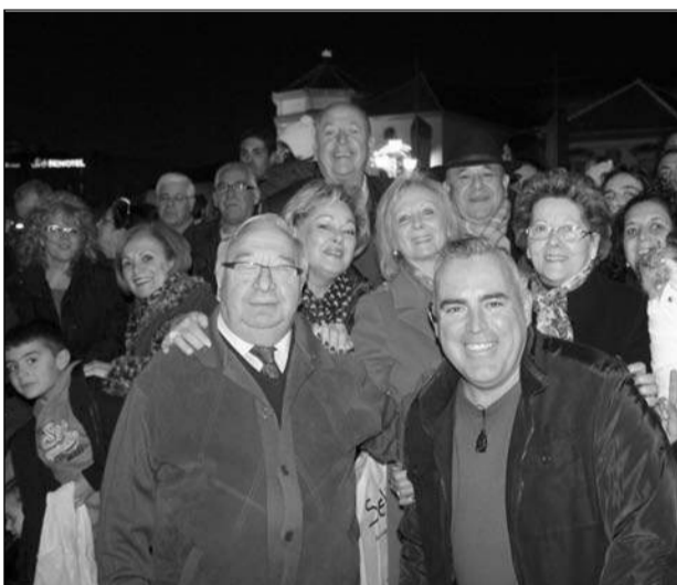
Directivos de la Federación, entre ellos el presidente, ven el desfile.