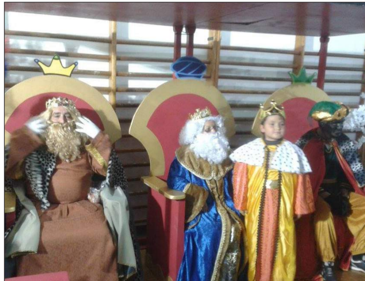
Los Reyes Magos en sus tronos recibieron a los niños.

Para los más pequeños hubo actividades de globoflexia, manualidades y pintacaras. Además, niños y niñas pudieron entregar sus cartas a Sus Majestades y fotografiarse con ellos. Ilusión a raudales por las calles de Bailén-Miraflores como anticipo de la mágica noche de Reyes que aguardaba al día siguiente.