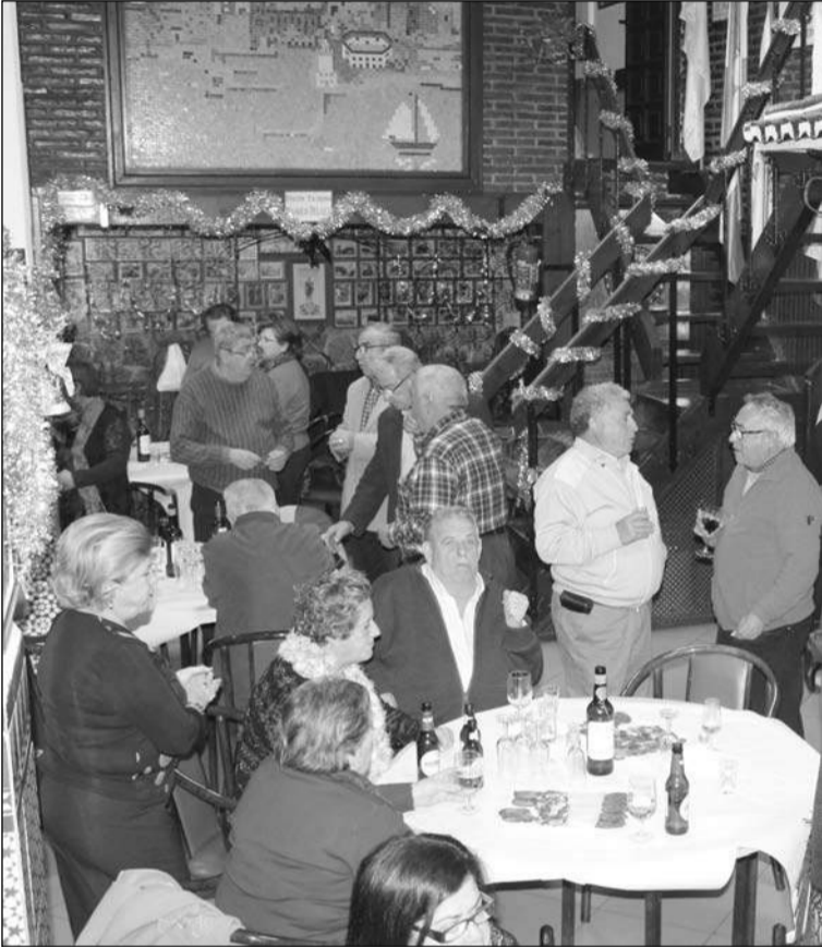
Numerosos socios se dieron cita para brindar por 2015.