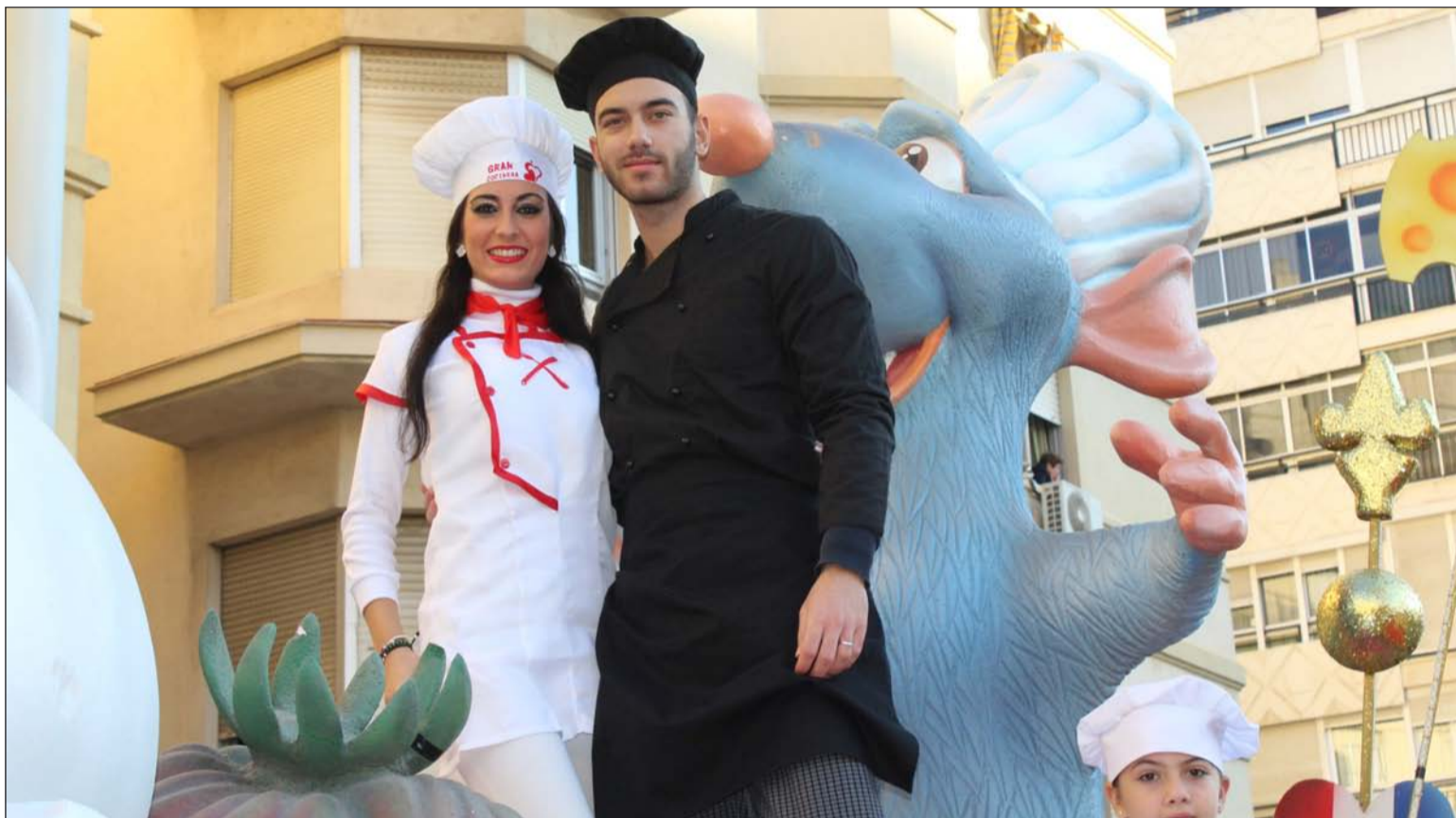
Carroza de la Federación Malagueña de Peñas, con la Reina y el Mister de la Feria.