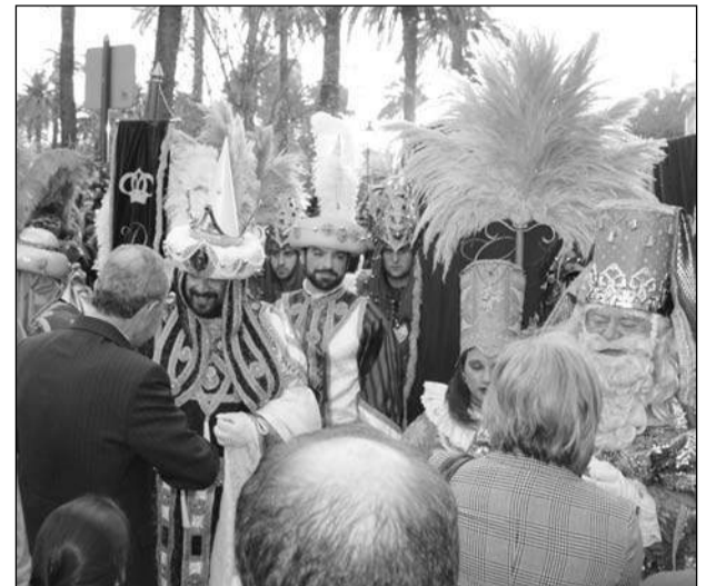
Recibimiento a los Reyes Magos en el Ayuntamiento.