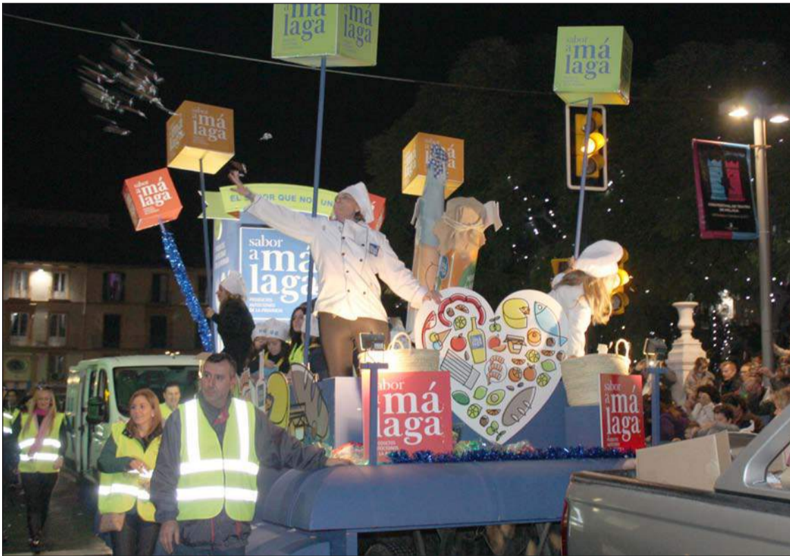
Carroza de Sabor a Málaga lanzando caramelos en la plaza de la Merced