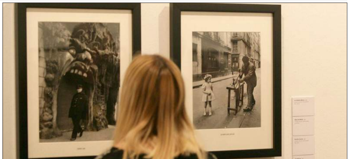
La muestra de Doisneau concluía el 7 de enero con más de 16.000 visitas.