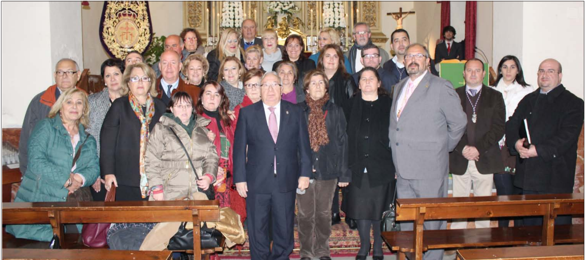
Representación del colectivo peñista y hermanos del Rocío tras la Eucaristía.

La Federación Malagueña de Peñas es Hermana Mayor Honoraria de esta cofradía, y acudió a la Misa celebrada en San Lázaro el pasado lunes