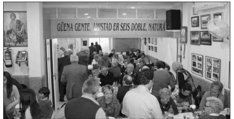
La sede se llenó de socios y simpatizantes.

Esta actividad tenía lugar en la propia sede de la Peña, ya que el acto servía también para pro-ceder a la reinauguración de la distrito Carlos Ortiz.