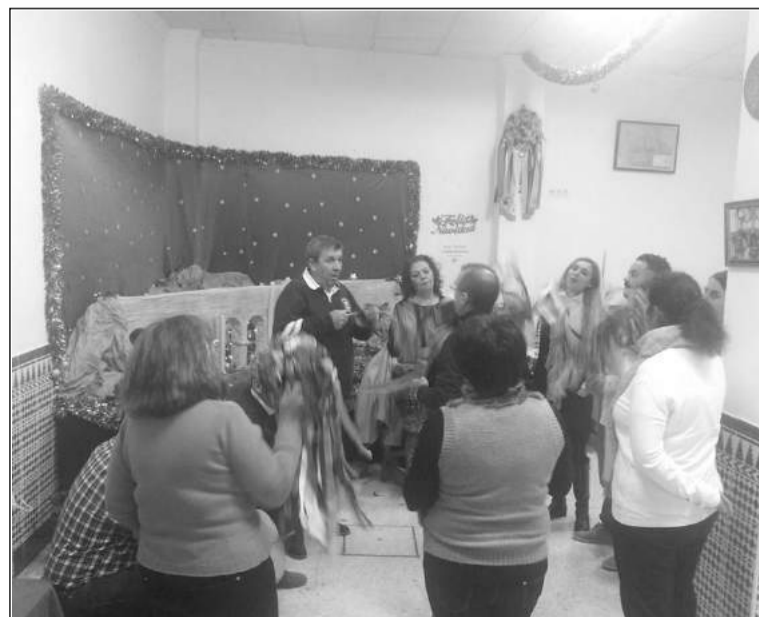
Miembros de la pastoral de Beneraife cantando al Belén.

Entre todos estos actos destacaba la Copa de Navidad del 2014 a la localidad granadina de Loja, diciembre, en la que se contó con