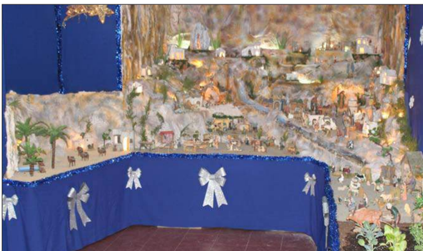
Casa de Álora Gibralfaro.