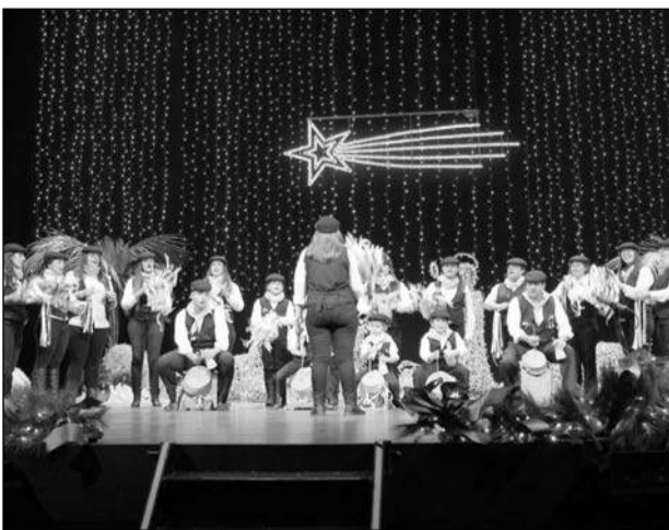
Pastoral El Carmen de Campanillas.