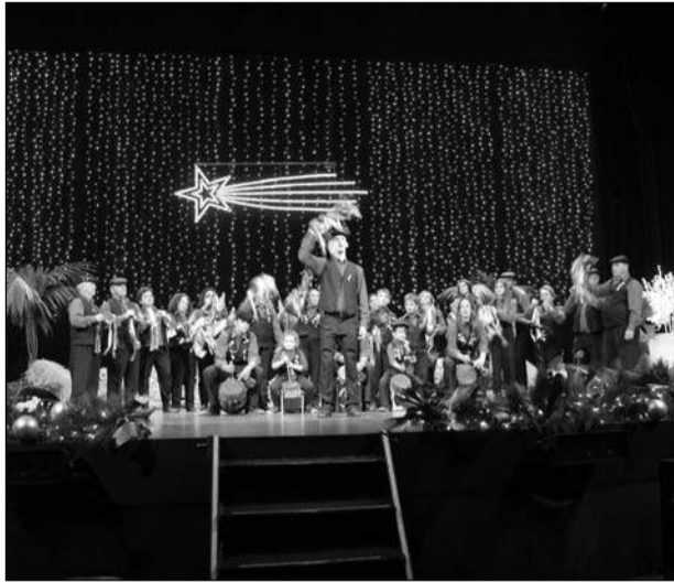
Pastoral Raíces del Sexmo,