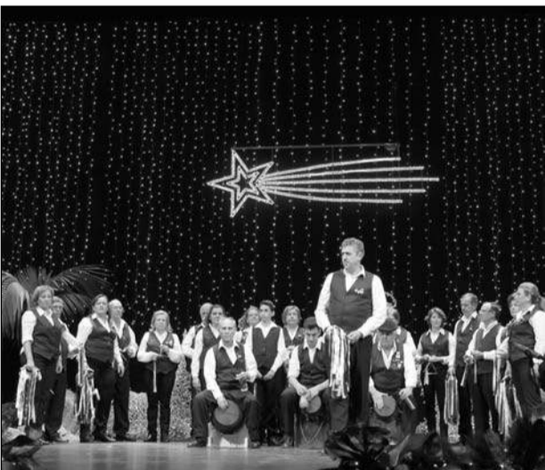
Pastoral Los Moras de Almogía.