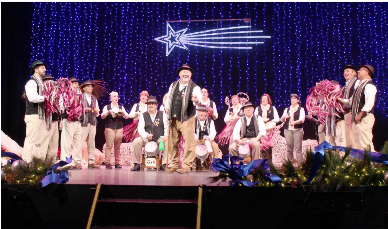
Pastoral de Amigos de Santa Cristina - Centro Cultural Renfe en el Encuentro celebrado el pasado 21 de diciembre en el Teatro Cervantes.

Número 565 31 de Diciembre de 2014 C/ Pedro Molina, 1 Tfno: 952 22 54 39 Fax: 952 21 48 82 E-mail: prensa@femape.com - la_alcazaba@hotmail.com Web: www.femape.com Edición digital: www.femape.com/laalcazabadigital Twitter: @FMPLaAlcazaba Búsquenos también en Facebook