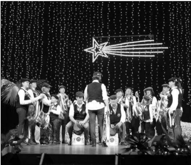
Pastoral Raíces de Colmenarejo.