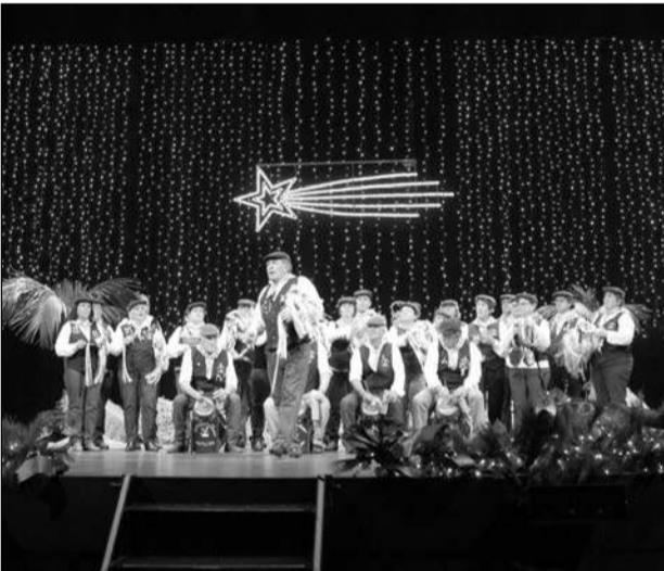
Pastoral La Ilusión de El Puerto de la Torre.