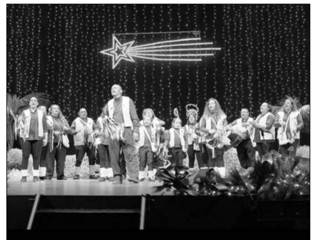
Pastoral de la Peña Los Pastores de Colmenarejo.