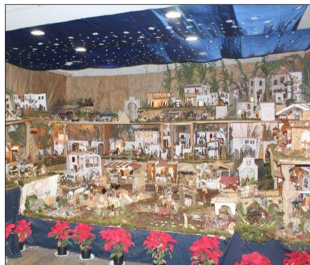
Asociación de Vecinos Zona Europa.