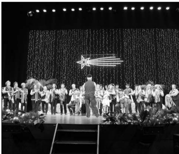
Pastoral Esta Gente de la Casa de Álora Gibralfaro.