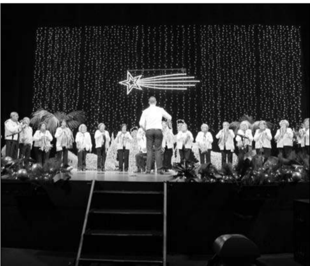
Pastoral Cosas Nuestras.