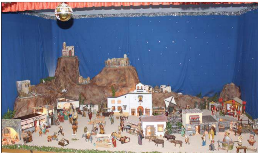
Peña La Biznaga.