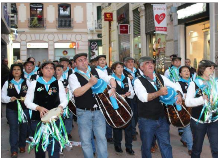
La calle Nueva fue uno de los lugares novedosos para este encuentro.