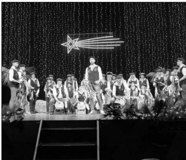
Pastoral Los Penosos.