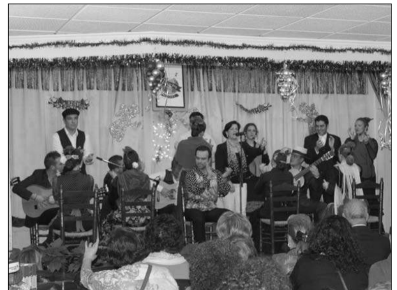
Representación de ‘El Café de la Loba’.