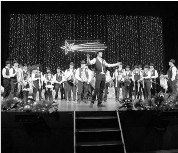
Pastoral Virgen del Rosario de El Borge.