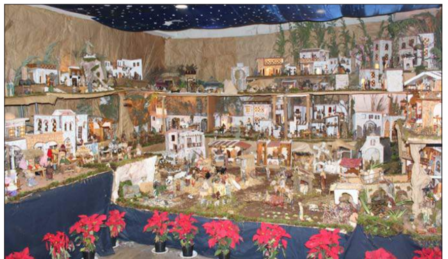
Asociación de Vecinos Zona Europa.