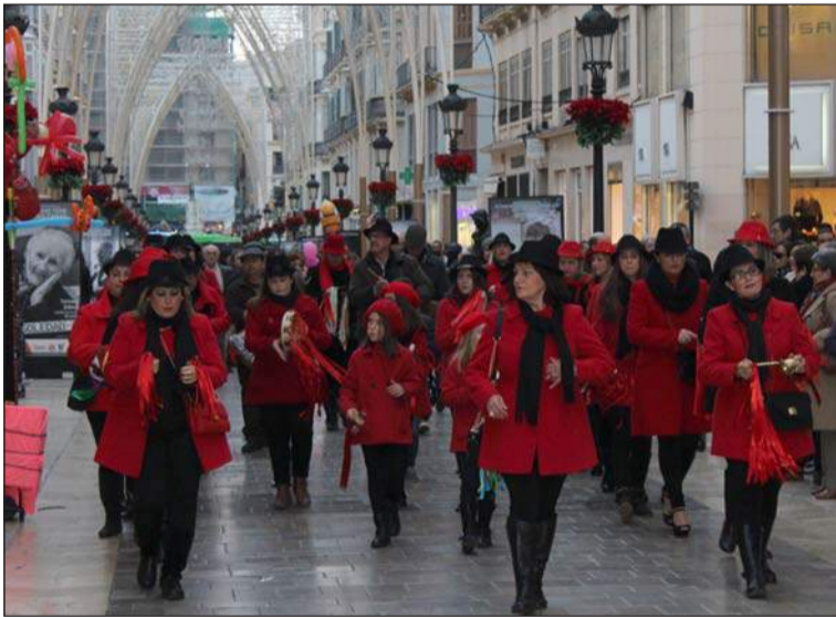
Una de las pastorales discurre por calle Larios.