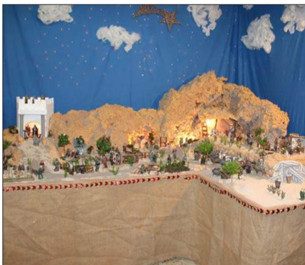
Peña Er Salero.