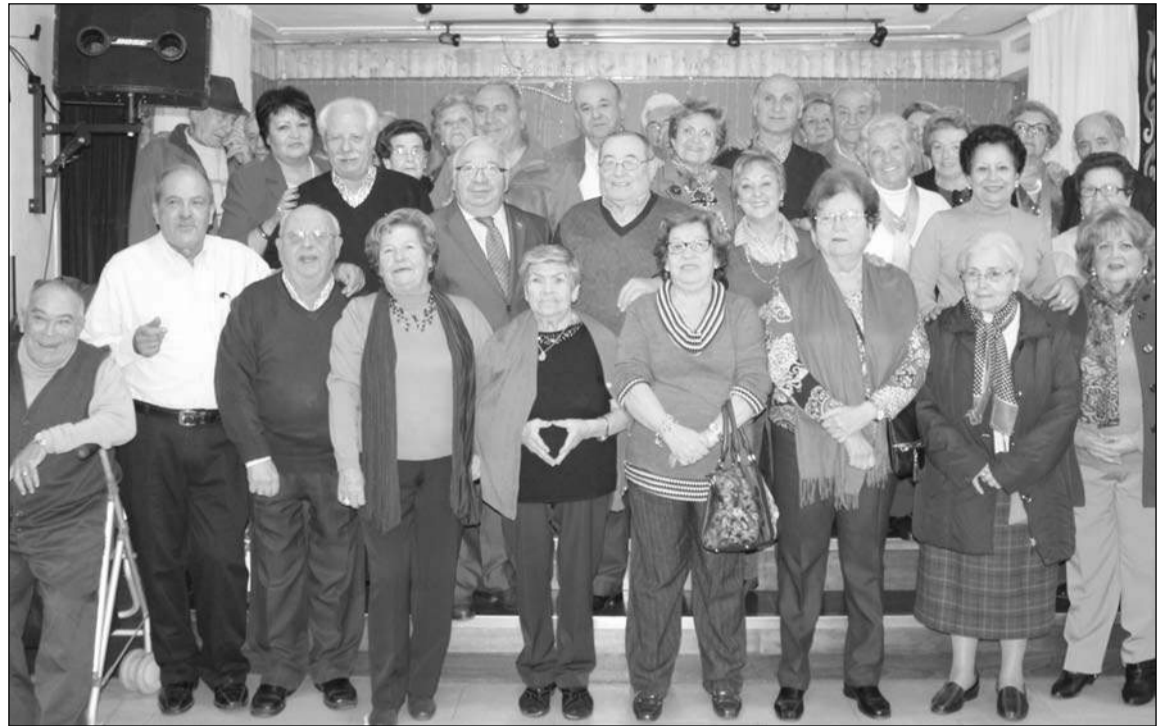
Asistentes a la comida de las Hermanitas de los Pobres con representantes de la Federación y de la entidad.