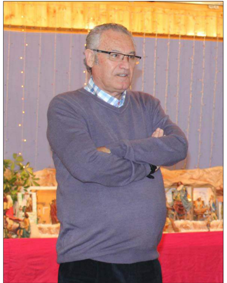
El presidente, en un acto reciente con los residentes de las Hermanitas.

J.G.- El corazón siempre lo tenemos partido, sobre todo porque el melillense es distinto a todos. Nos hemos criado entre