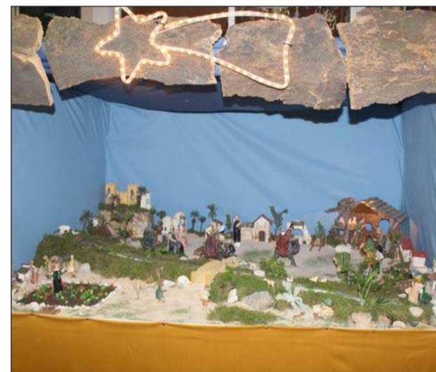
Peña Ciudad Puerta Blanca.