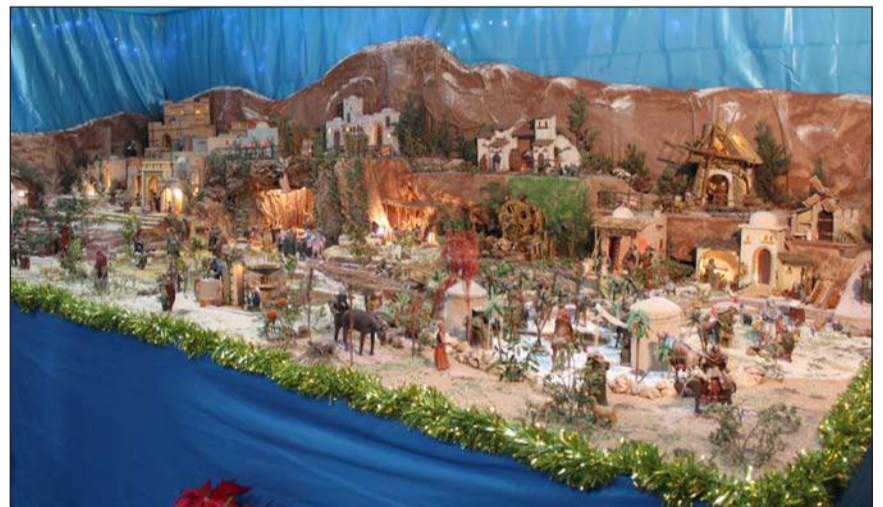
Peña El Palustre.