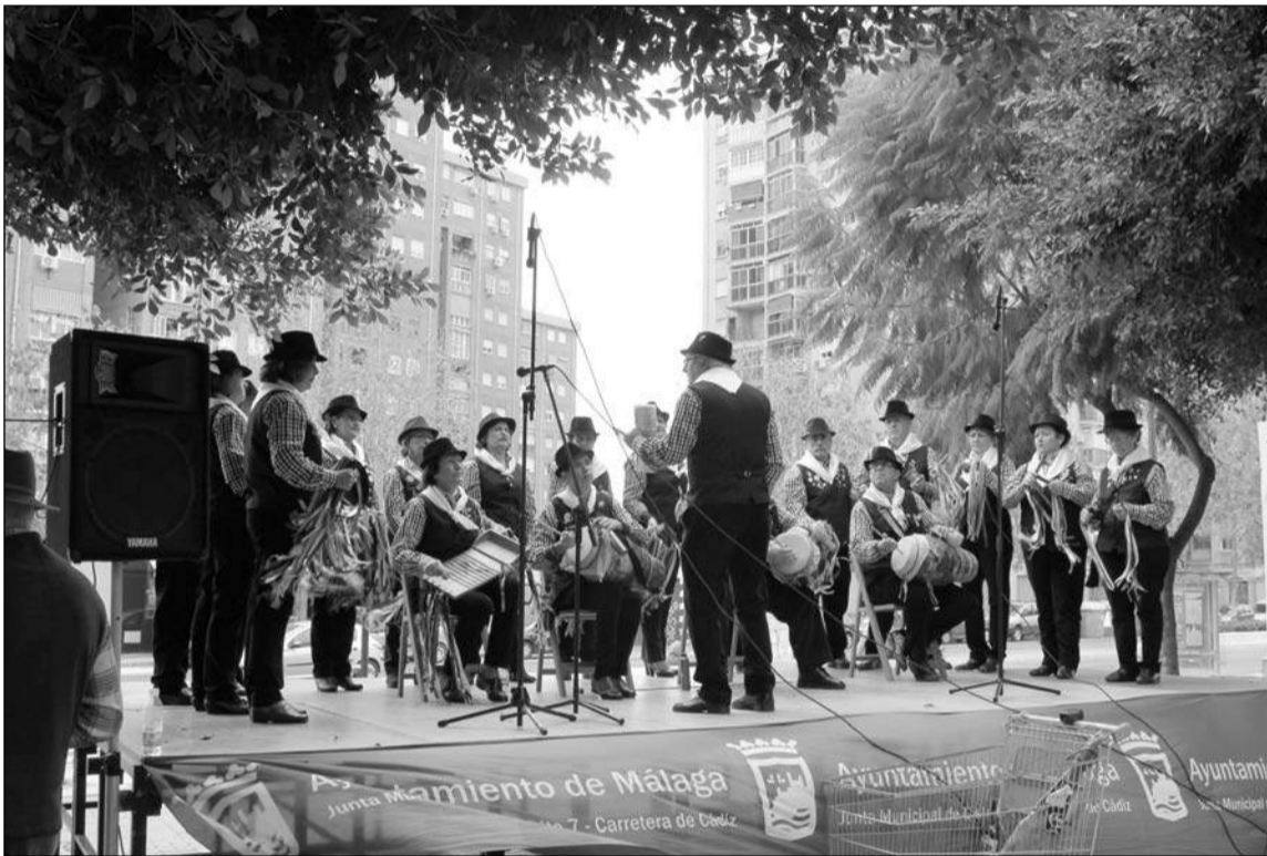
Intervención de la pastoral de la entidad.

partir de las 12:30 horas, su XIII Encuentro de Pastorales, que en el padre Damián de Molokai, Desde esta entidad federada recaudó la cantidad de 1.308 euros para Cáritas. La Asociación de Vecinos Zona Europa celebraba esta edición se celebraba precisamente delante de la iglesia se instaló una barra, y todo el día se benefició de Cáritas de la Parroquia. Así, se fueron sucediendo actuaciones de diferentes barrios que se recaudó fue igualmente Al mismo tiempo, los vecinos disfrutaron pasando un día de fraternidad, con el fin de acercarse a los más necesitados, intentando llevar la esperanza a los hogares de las familias que más lo necesitan de sus barrios.