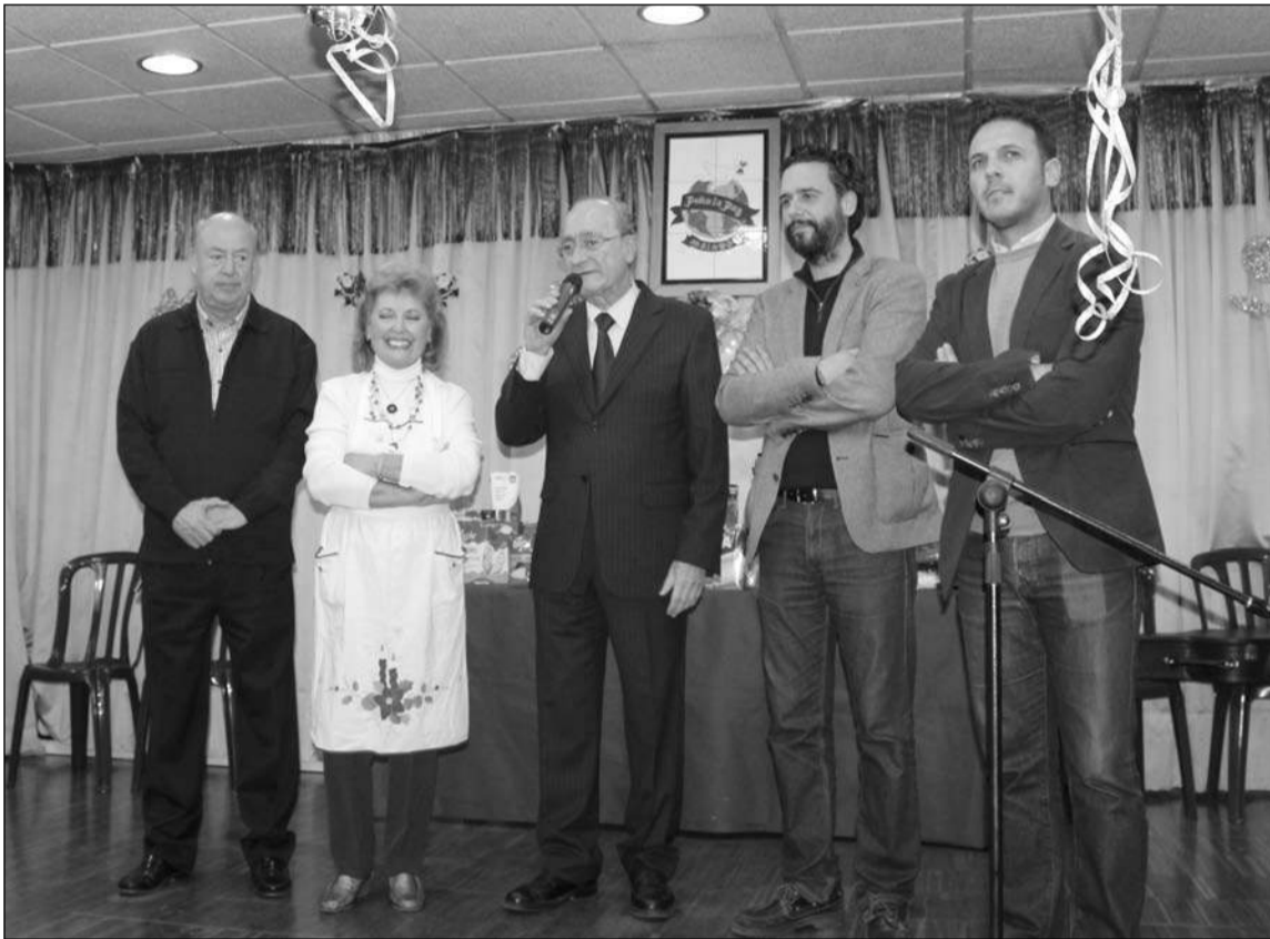
Intervención del alcalde en el acto de los borrachuelos.

perera de la Nochebuena a un buen número de socios, fundamentalmente mujeres, para vivir una de las mayores tradiciones de la navidad, como es la tradición de los borrachuelos. Esta actividad tenía lugar en la tarde del pasado 22 de diciembre; contándose con la presencia de una representación de