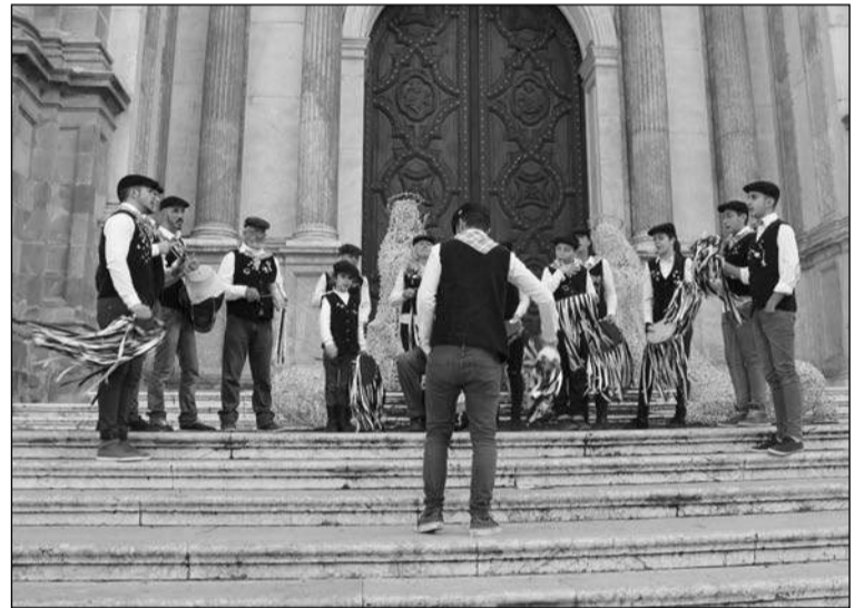
Pastoral de la Peña Los Penosos.