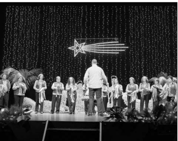
Pastoral de la Asociación de Vecinos Las Marina.