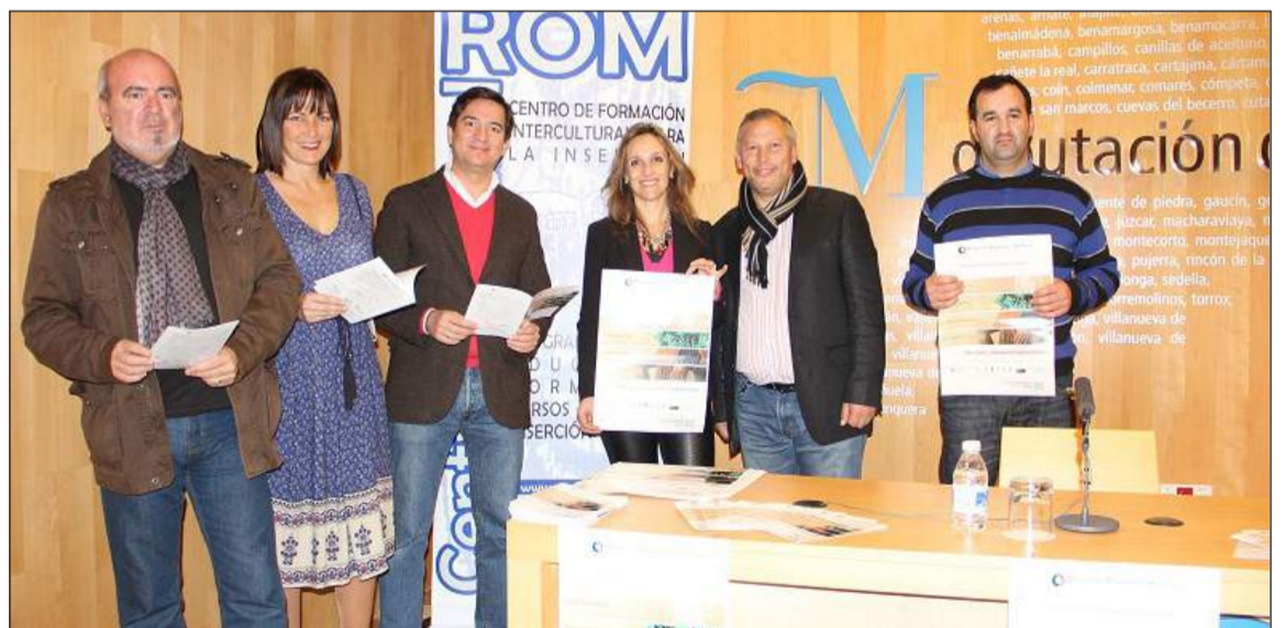
Presentación del programa 'Málaga Flamenca'.

Además de los cursos de formación sobre el flamenco en general este paquete de acciones contempla un amplio abanico de actividades como cursos específicos para impartir como actividades extraescolares de los centros educativos, formación ocupacional para el empleo en la formación del flamenco o cursos especializados para el profesorado en esta materia.