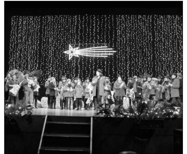
Pastoral La Biznaga de Guaro.