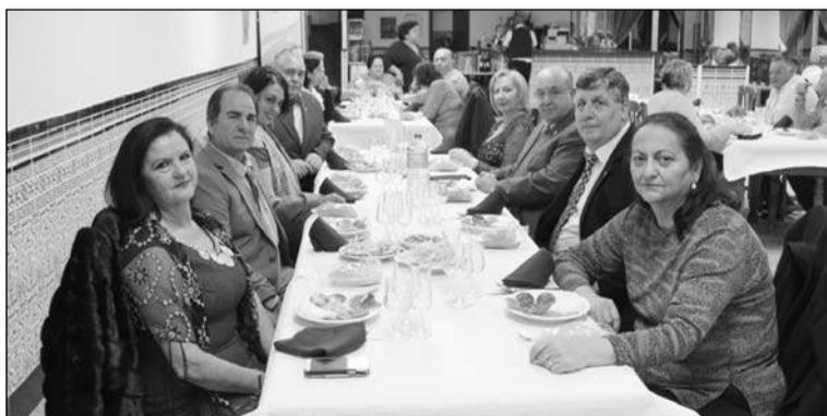
Imagen de la cena navideña.

La Peña Madridista El Palo sábado 20 de diciembre, con cumplió con su tradición de una cena en la Venta El Gato en unir a sus socios en vísperas de la Navidad para celebrar estas fiestas y brindar por un próspero año 2015. La cita fue en la noche del sábado 20 de diciembre, con la Navidad para celebrar estas fiestas y brindar por un próspero año 2015. La cita fue en la noche del sábado 20 de diciembre, con la Navidad para celebrar estas fiestas y brindar por un próspero año 2015.