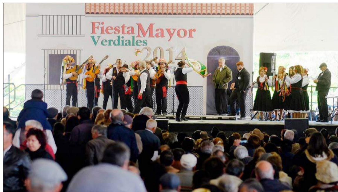
Una de las pandas actuando durante el concurso.

Hay que recordar que a principios de este año el Ayuntamiento de Málaga aprobó una moción institucional para solicitar a la UNESCO la declara-