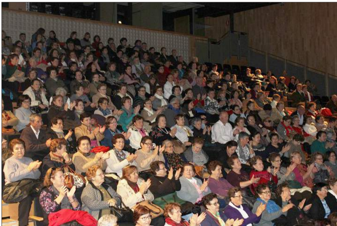
Vista del Auditorio de la Diputación, repleto de mayores procedentes de toda la provincia.

La vicepresidenta de la Diputación hizo hincapié en que la 'Semana de Navidad' "ha sido organizada con todo el cariño" y ha destacado que "la Diputación es la casa de todos los malagueños y por eso para esta institución el bienestar y la salud de los mayores es un objetivo prioritario".