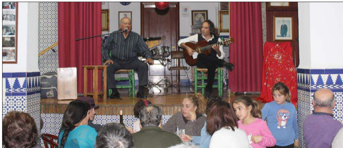
Migas Flamencas de Nochebuena.