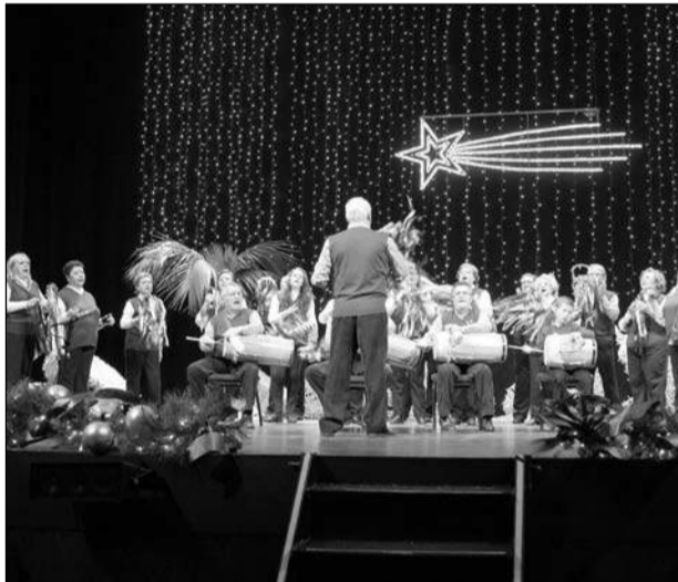
Pastoral de la Peña El Parral.