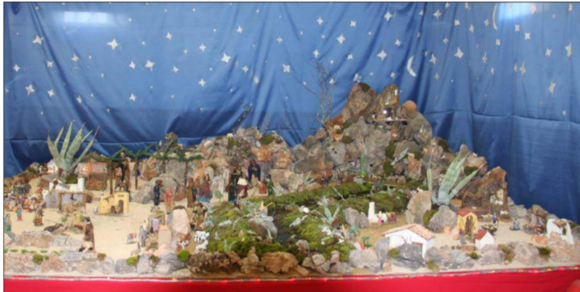
Peña La Virreina.