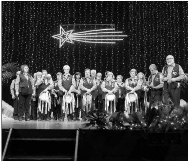
Pastoral de la Asociación de Vecinos Zona Europa.