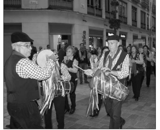
Las pastorales crearon gran ambiente en calle Larios.