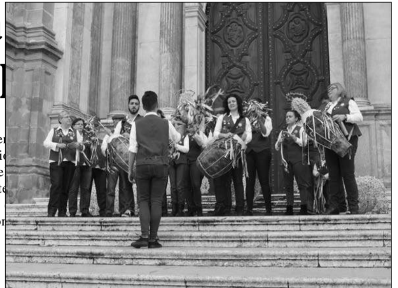
Pastoral de la Peña Finca La Palma.