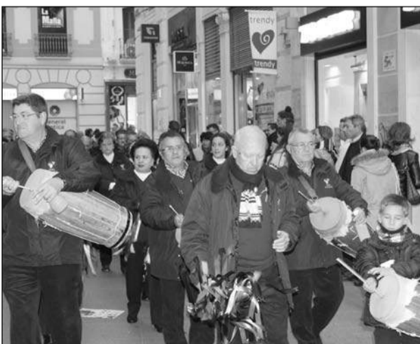
La pastoral de la Peña El Parral, por calle Nueva.