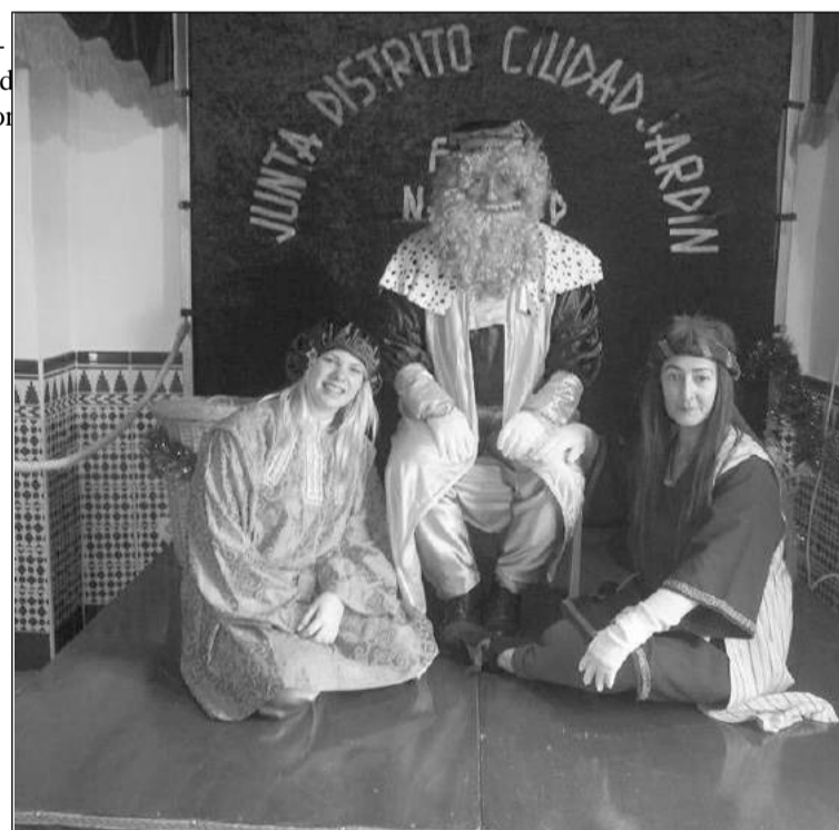
El Paje Real con sus ayudantes.

Entre todos estos actos destacaba la Copa de Navidad del 2014 a la localidad granadina de Loja, diciembre, en la que se contó con