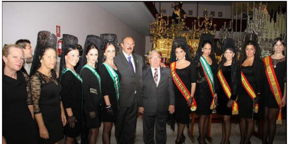
Ofrenda 'Un Clavel para el Rocío' del pasado Lunes Santo de 2014.

Desde la Cofradía del Rocío se invita a los integrantes de todas las Peñas de Málaga a participar en este acto, así como quien pueda se sume a los cientos de donativos de piezas de oro, por muy pequeñas que sean, que llegadas de todos los lugares de la ciudad van a hacer posible que la Coronación de la Virgen del Rocío sea un crisol denodado de malagueños que quieren ver a la Novia de Málaga radiante y esplendorosa en la mañana del 12 de septiembre de 2015.