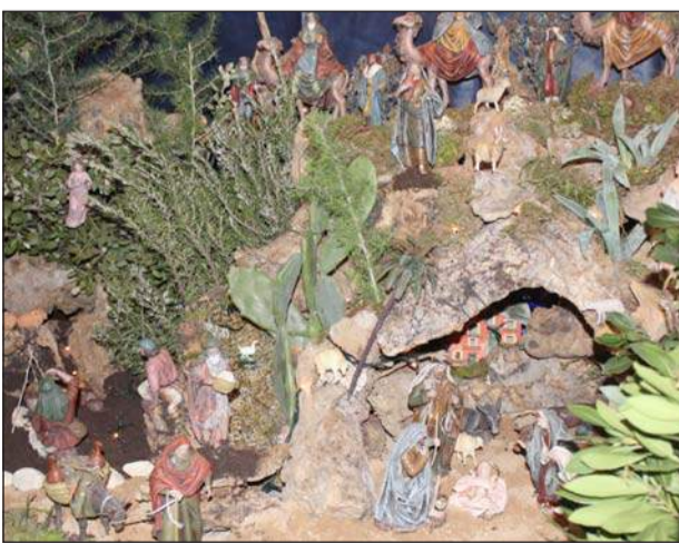
Peña La Paz.