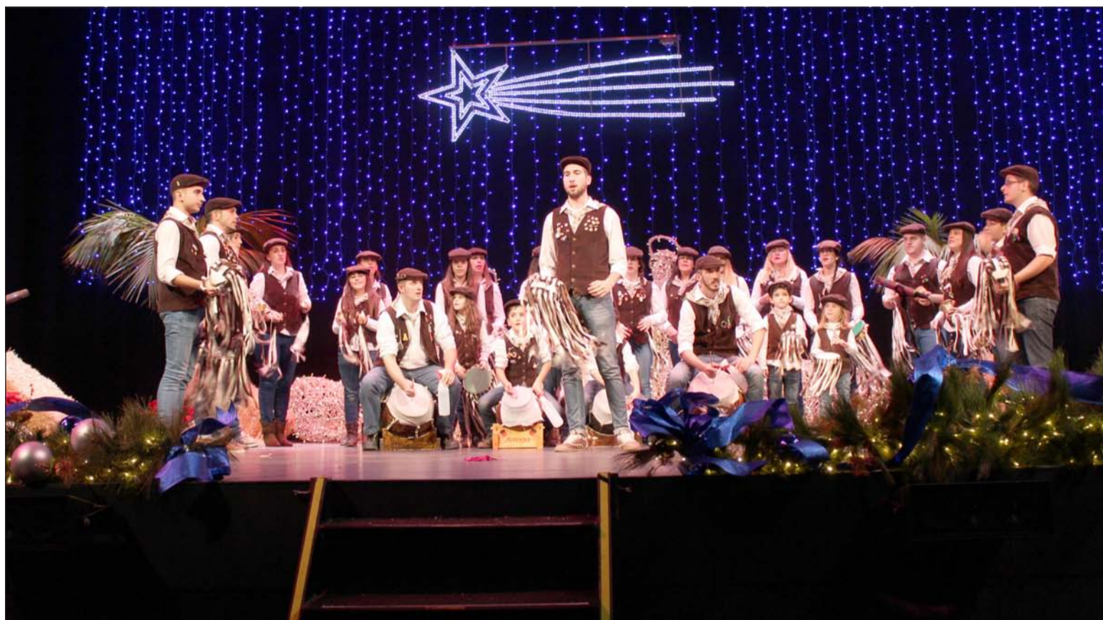
Actuación de la Pastoral de Los Penosos en el Cervantes.

Pero tras actuar en la calle aún quedaba por pisar las tablas del teatro Cervantes. A partir de las 19:00 horas comenzaba el discurrir de pastorales en un encuentro en el que la participación de cada una de las pastorales fue de un villancico, con una duración máxima de cinco minutos. Así, el resultado fue un espectáculo dinámico que, a pesar de la cantidad de actuantes, resultó muy ameno para todos los asistentes