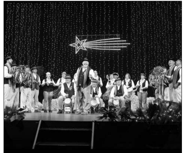
Pastoral Amigos de Santa Cristina Centro Cultural Renfe.