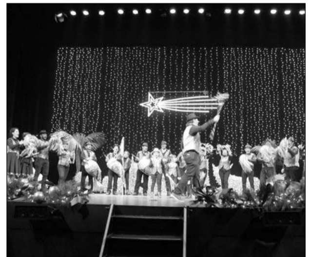
Pastoral de Frigiliana.