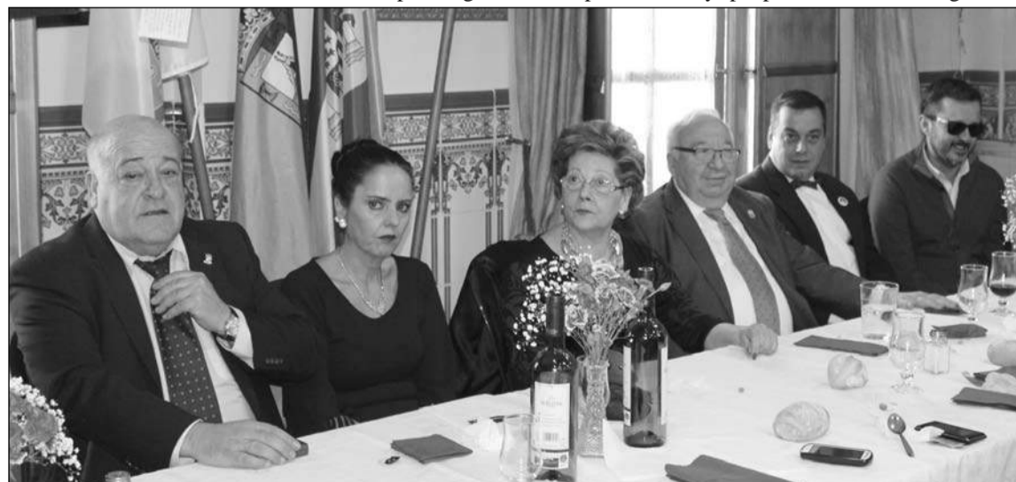
Una de las actuaciones de la final de la Operación Salero.