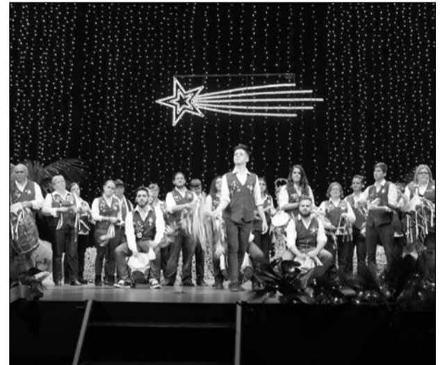
Pastoral de la Peña Finca La Palma.