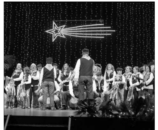
Pastoral de Santo Domingo.