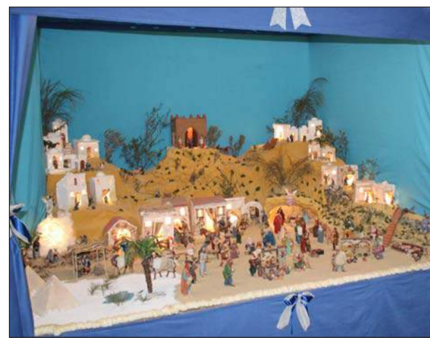
Peña Costa del Sol.