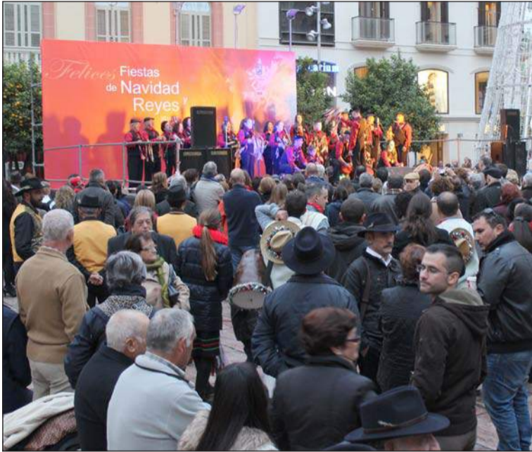
Ambiente navideño alrededor del escenario de la plaza de la Constitución.

Coincidiendo con este acto, la Federación Malagueña de Peñas hizo entrega de los premios de su XXIII Certamen de Belenes 'José María Martín Carpena', tal y como se reseña en páginas interiores de esta misma publicación.