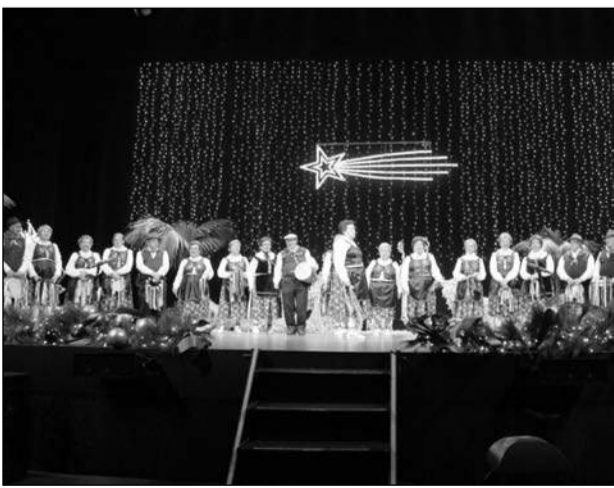
Pastoral Cruz de Pinto de Frigiliana.