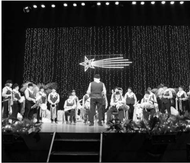
Pastoral Mi Gente.