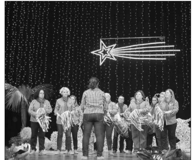
Pastoral de la Peña Santa Cristina.