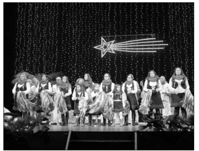
Pastoral Amigos de los Ángeles.