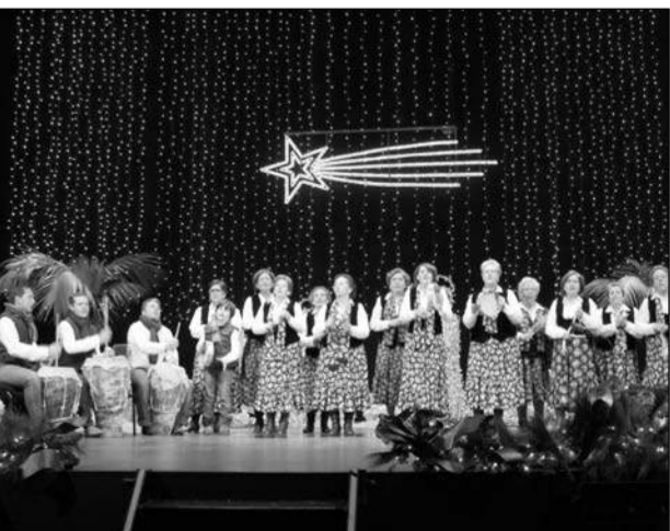
Pastoral de Ardales.