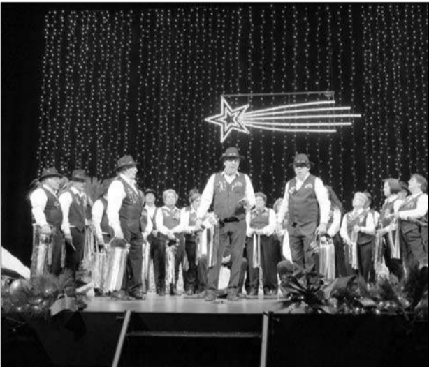
Pastoral Las Lagunas de Mijas.