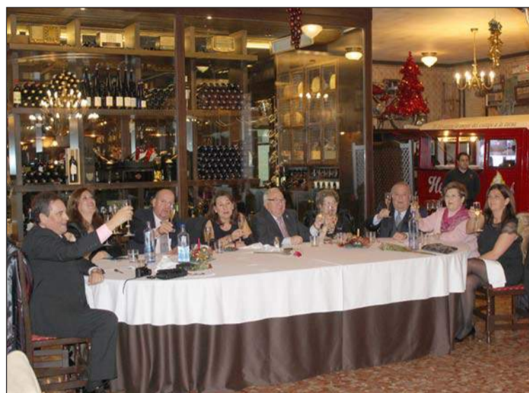
Brindis de los miembros de la mesa presidencial.