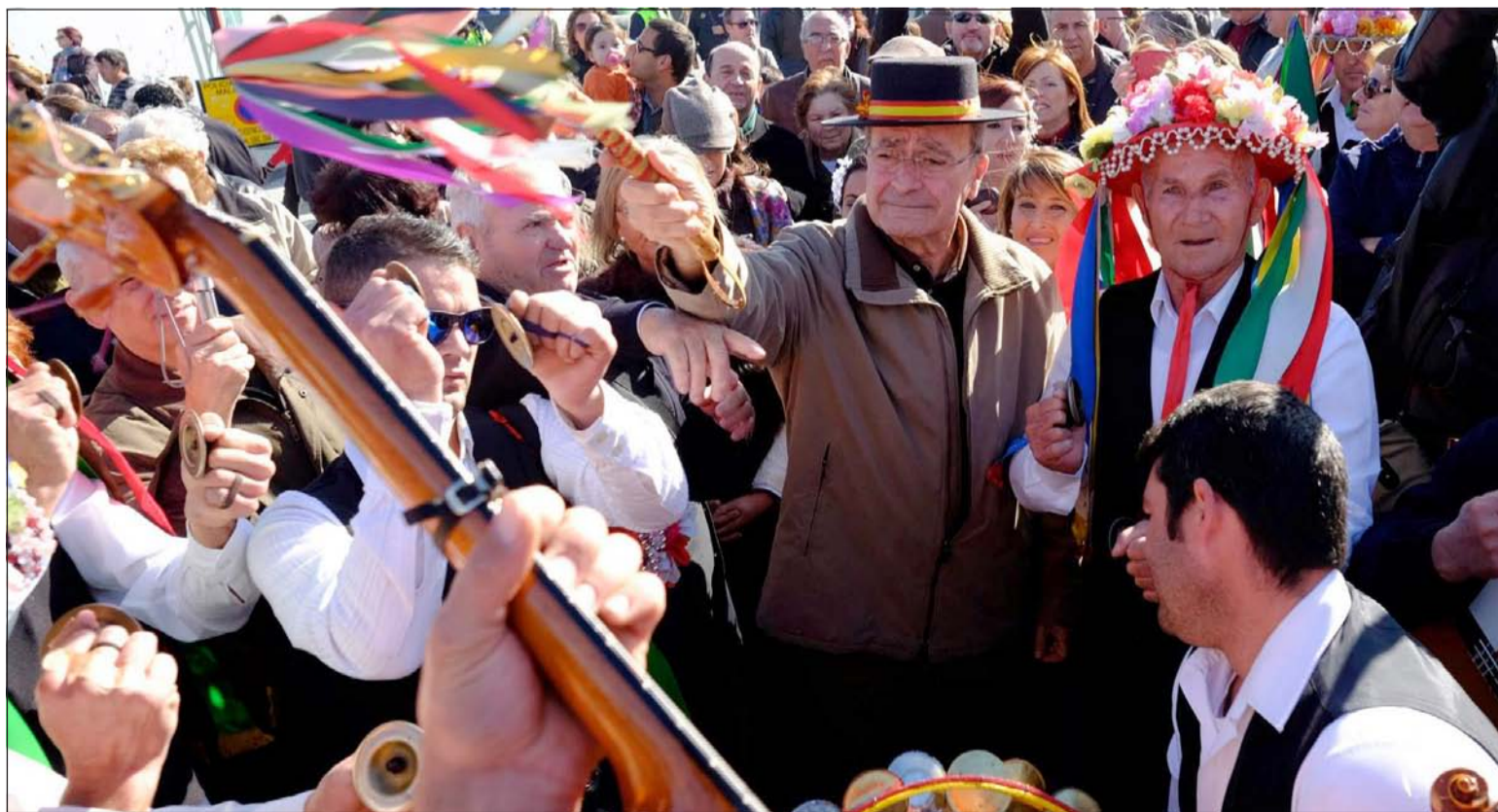
El alcalde, con sombrero, dirige una de las pandas.

En total, las pandas participantes se repartieron 6.850 euros en un total de 25 premios distintos.