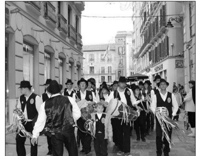
Inicio del pasacalles para una de las pastorales participantes.