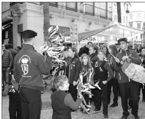
Puerta del Mar fue uno de los nuevos enclaves del pasacalles