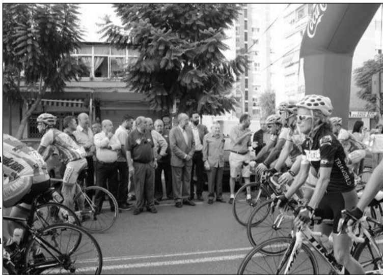
Salida de los participantes, con las autoridades de espectadores.