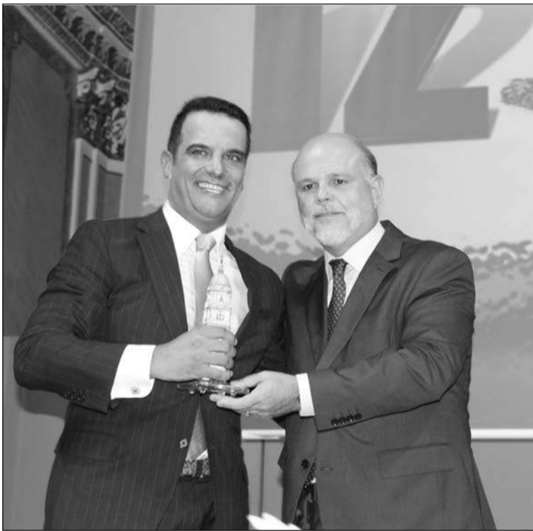
Entrega de un reconocimiento al director del hotel Málaga Palacio.