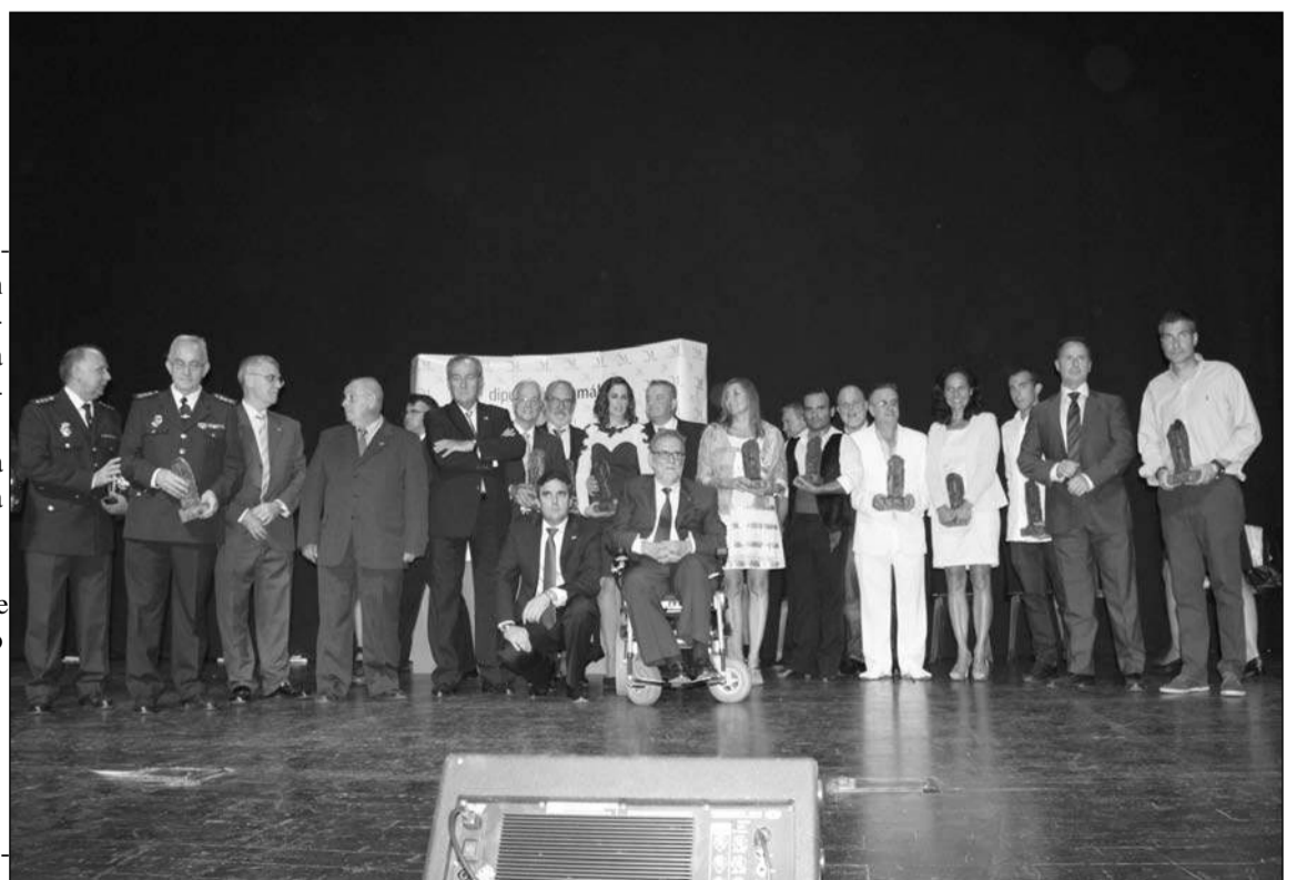
Premiados en estos galardones de la Asociación Málaga Siglo XXI.

Promocionar la provincia y fomentar Málaga allí donde van.