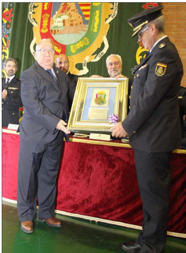
Entrega de un cuadro conmemorativo por parte de la Federación.