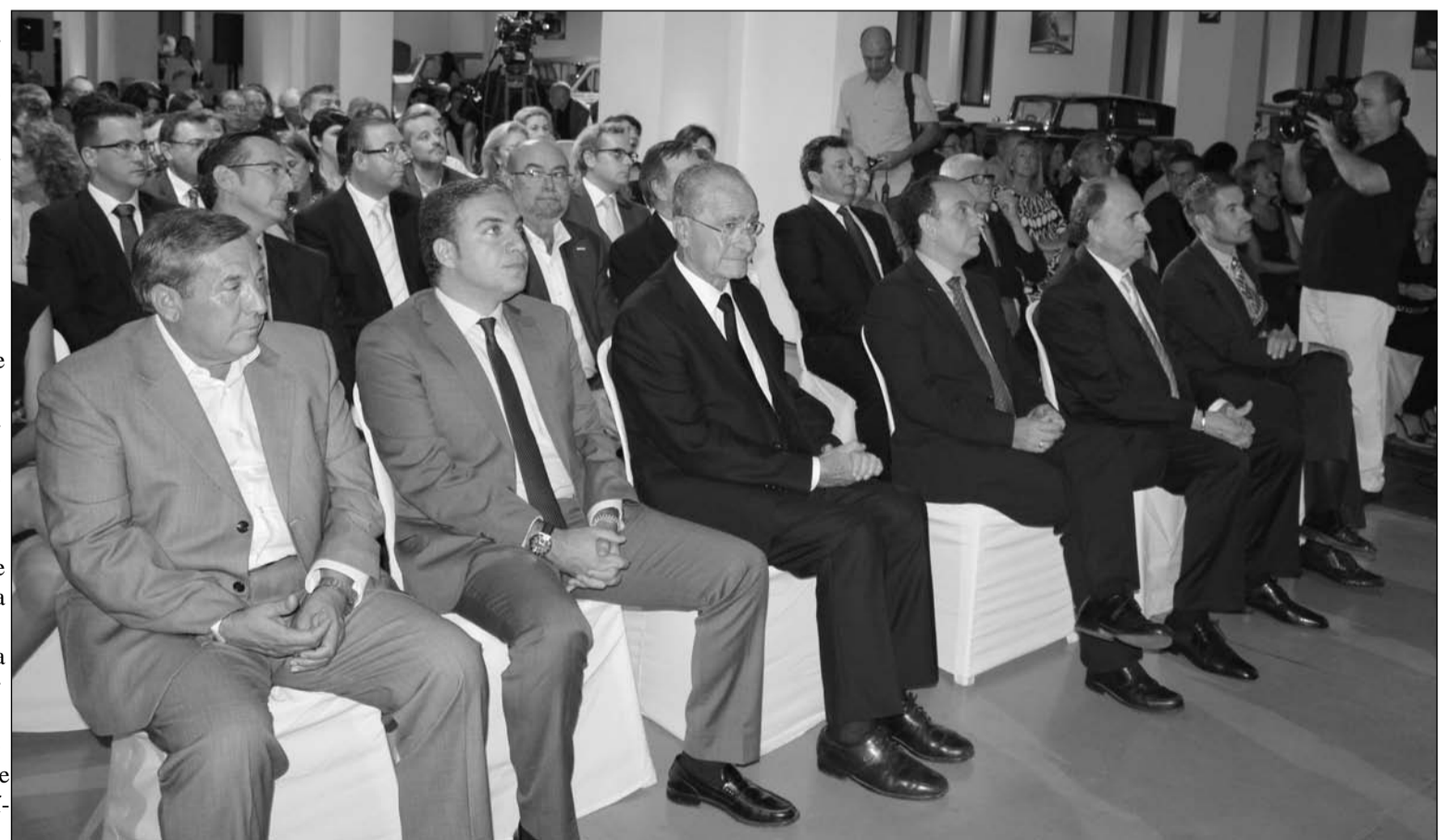
Autoridades presentes en este acto celebrado el pasado 26 de septiembre.