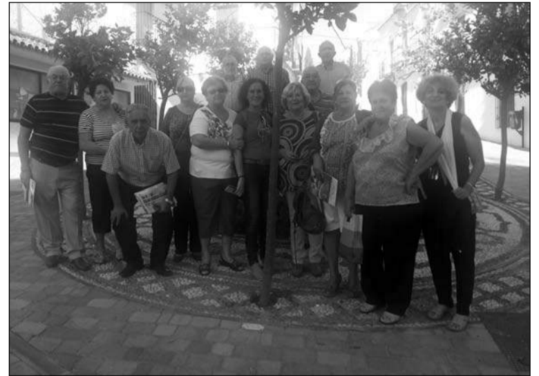
Grupo que visitó Estepona.