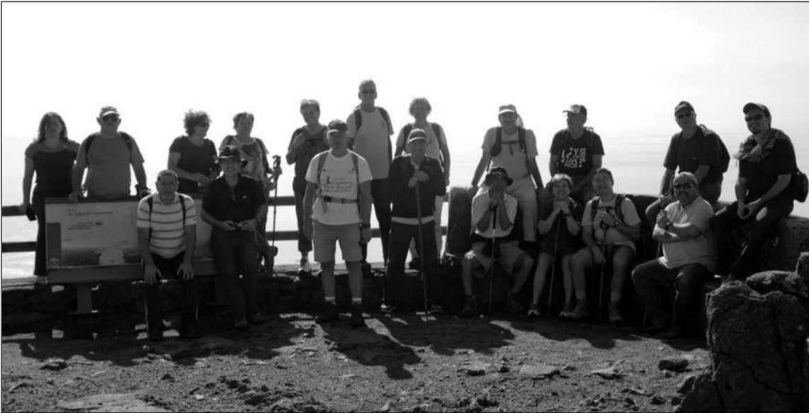
Grupo que realizó la ruta senderista.