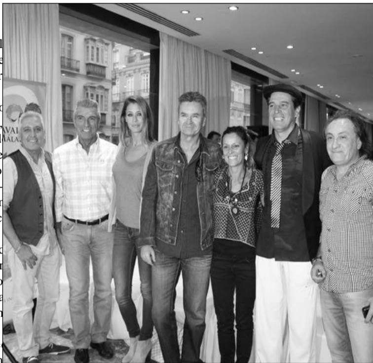
Pregoneros de ediciones anteriores.