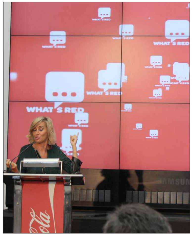
Un instante de la presentación de la aplicación.