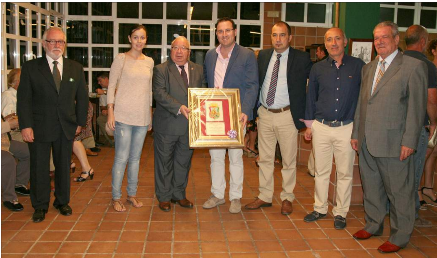
Inauguración del nuevo local, con la presencia de autoridades municipales y representantes de la entidad y la Federación de Peñas.

Número 559 8 de Octubre de 2014 C/ Pedro Molina, 1 Tfno: 952 22 54 39 Fax: 952 21 48 82 E-mail: prensa@femape.com - la_alcazaba@hotmail.com Web: www.femape.com Edición digital: www.femape.com/laalcazabadigital Twitter: @FMPLaAlcazaba Búsquenos también en Facebook