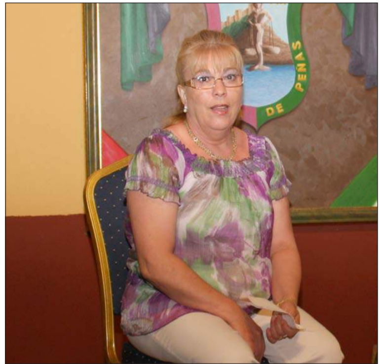
La presidenta, en una imagen de archivo.

P.M.- Sobre todo nos sentimos respaldados ante cualquier duda que pueda surgir. Estamos arropados y al mismo tiempo se nos