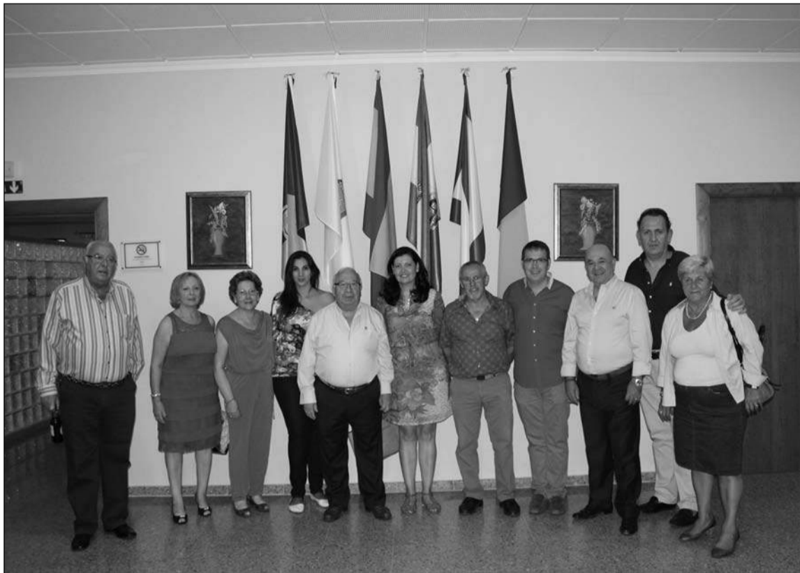
Directivos de la Peña Finca La Palma con invitados municipales y de la Federación de Peñas.