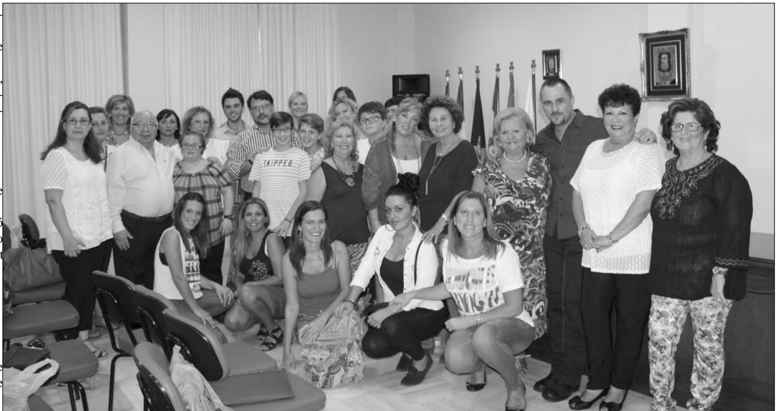
Participantes en la Escuela de Copla 'Miguel de los Reyes', con representantes de la Federación.

Los directivos de la Federación pudieron comprobar in situ las evoluciones de los alumnos inscritos, y que ahora tendrá unos meses para seguir avanzando en su formación antes de la clausura de este curso, que como es tradicional se realizará a lo largo del mes de diciembre con una gala en la que actuarán