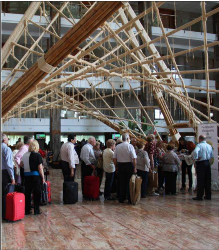
Inscripción de los participantes en el hall de uno de los hoteles del complejo.

Esta actividad es exclusiva para mayores de 65 años, pudiendo cada entidad inscribir a través de su presidente a una pareja hasta completar las plazas limitadas con las que se cuenta.