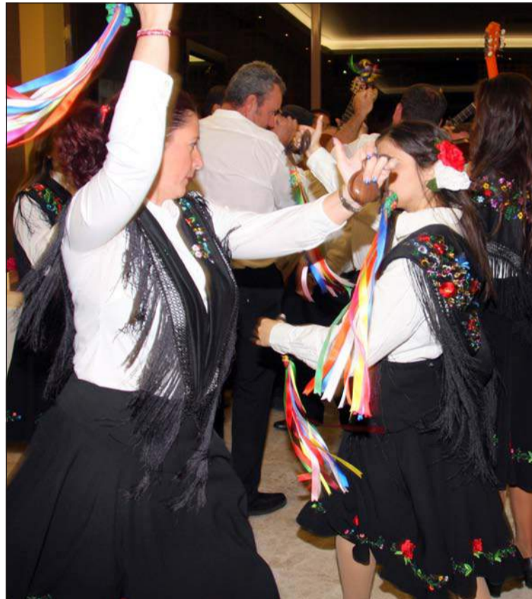
Verdiales en el Aniversario del pasado año.

Entidades colaboradoras con esta publicación: