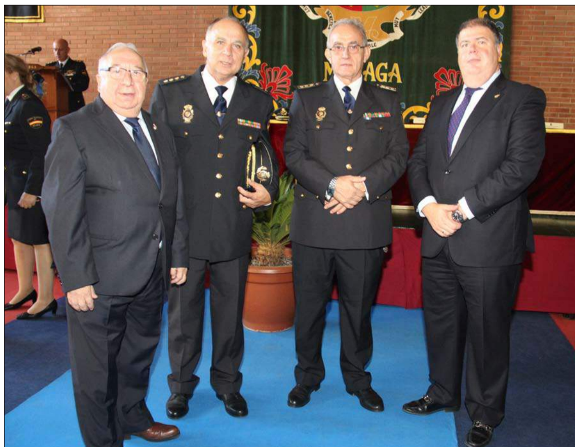
El presidente de la Federación de Peñas y el Hermano Mayor de la Congregación de Mena, con mandos policiales.