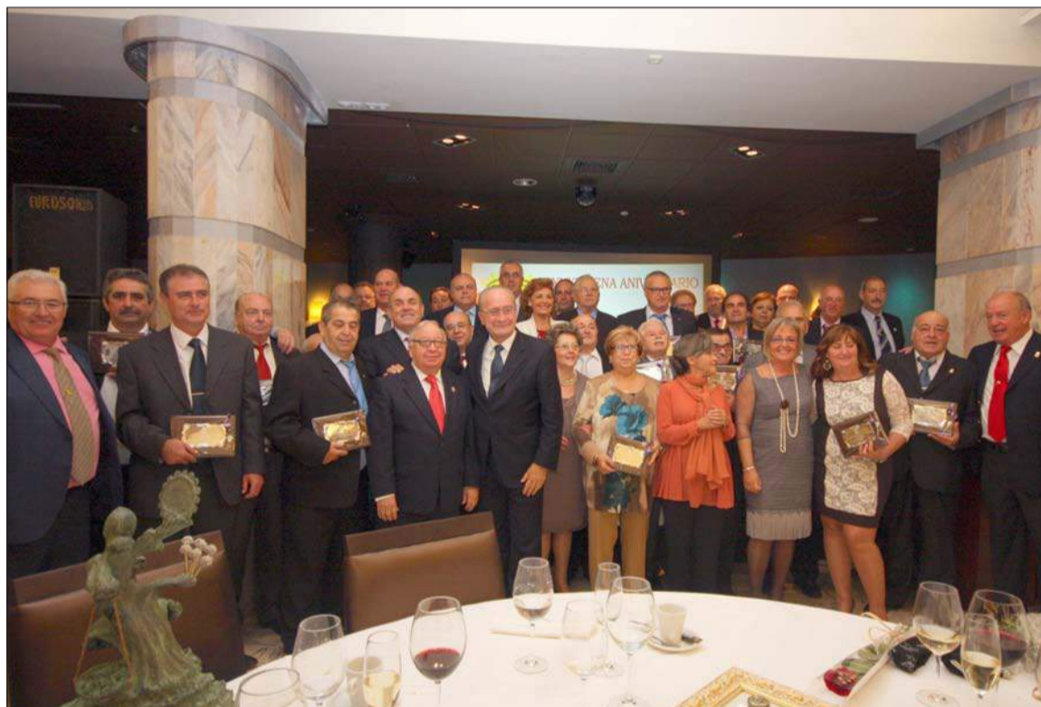
Autoridades, peñistas y galardonados, en el acto de aniversario de 2013 en Pórtico de Velázquez.

Como es tradicional, se invita a todas las entidades que componen este colectivo a que participen en esta actividad, que viene a simbolizar la importancia de la unidad de las peñas a través de su Federación. Igualmente, se contará con la presencia de autoridades y de patrocinadores y colaboradores.