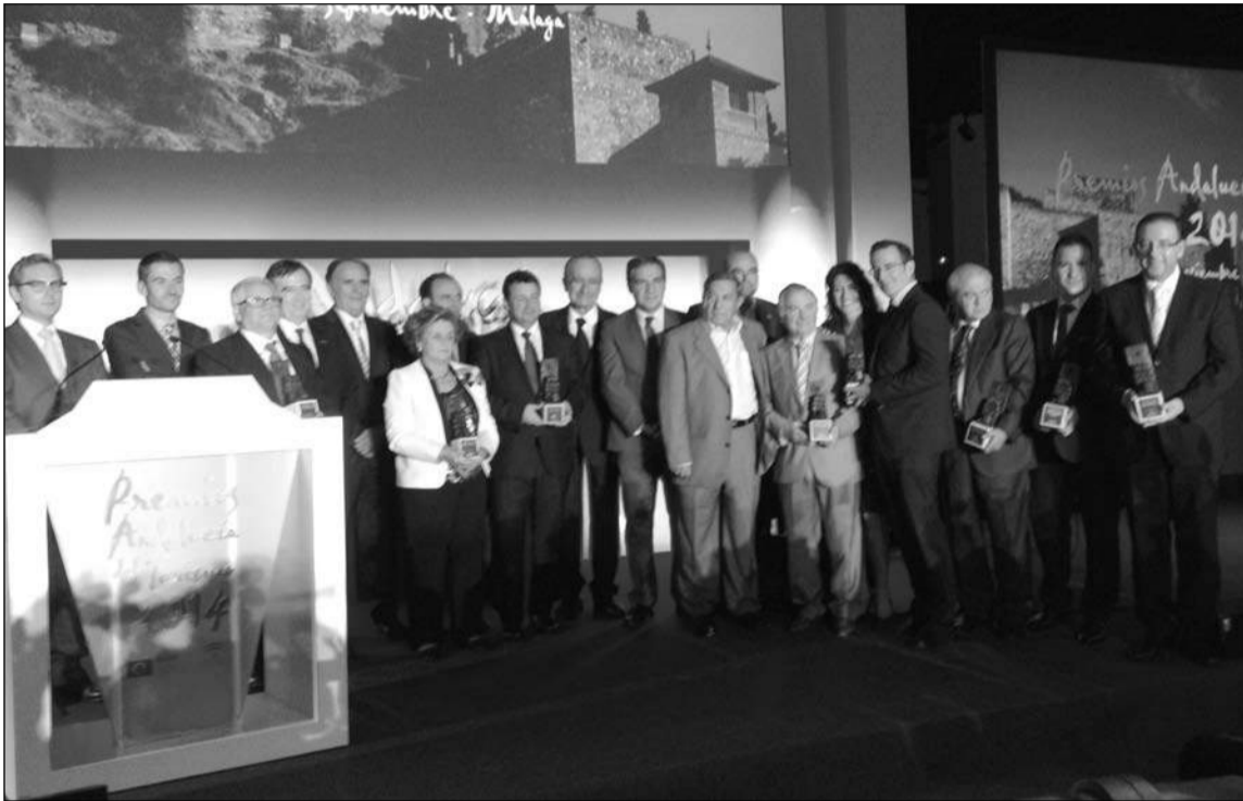
Premiados en estos galardones.