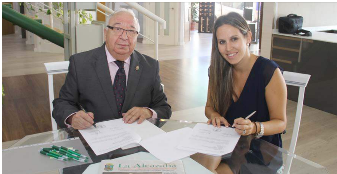
Firma de la renovación del convenio.

Desde Tesesa se apuesta por las tecnologías más vanguardistas para crear puertas y darles la mejor calidad, todo esto sin olvidar de cuidar con mimo y tradición cada detalle.