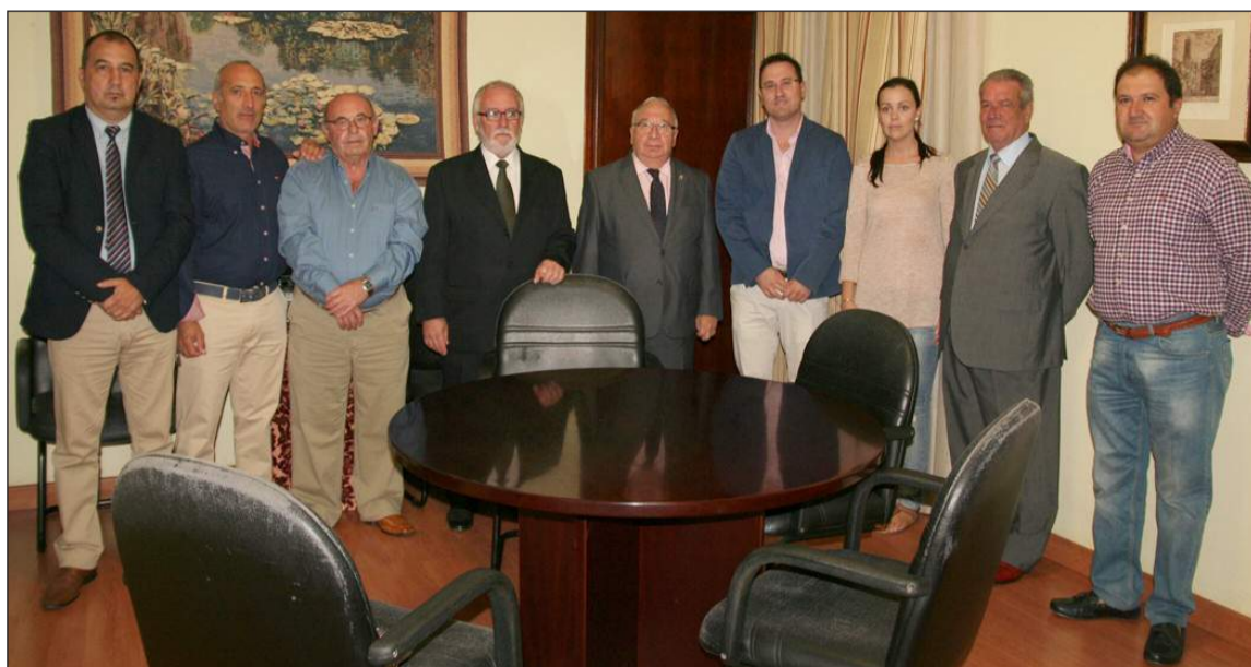
El alcalde y concejales recibieron a los componentes de La Gañana y la Federación en el Ayuntamiento antes del acto.