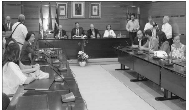
Acto de presentación del centro.