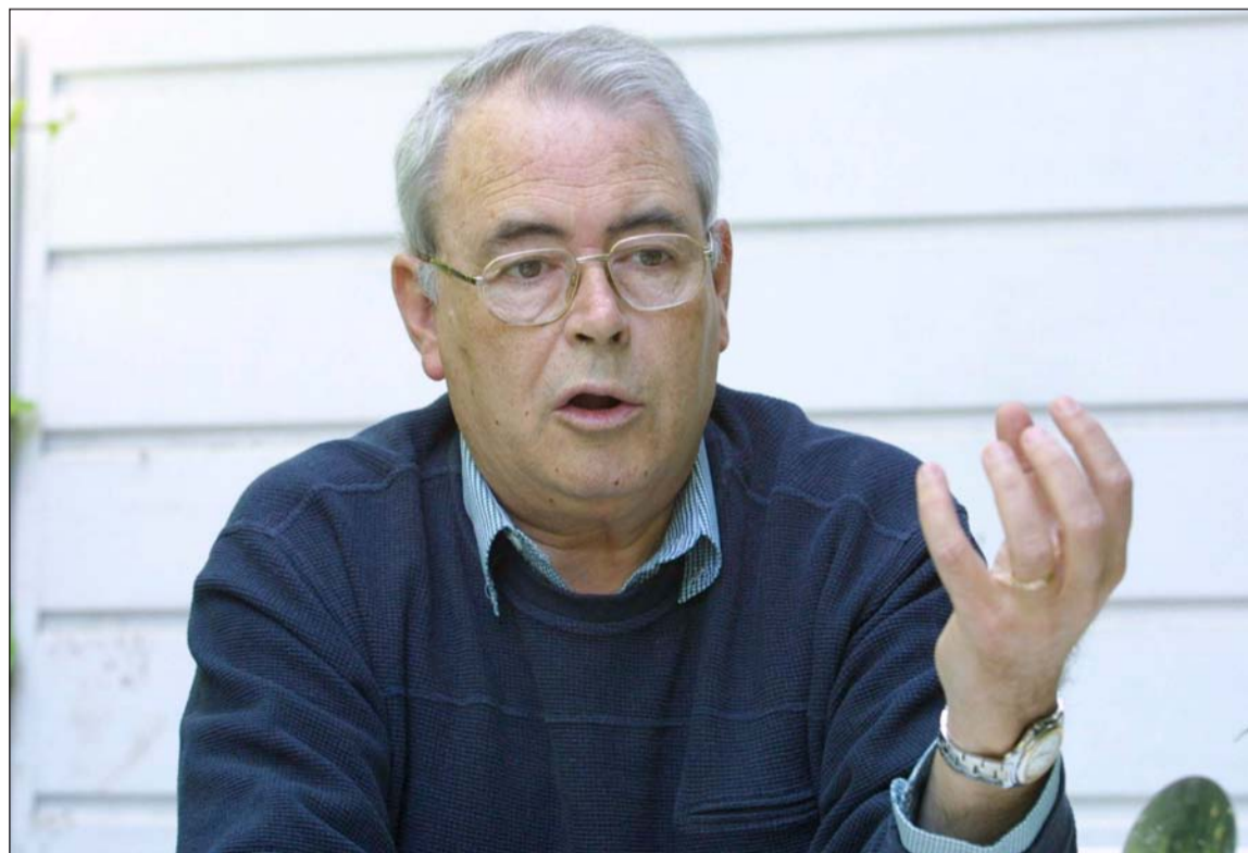
Imagen más reciente del ex alcalde Pedro Aparicio.