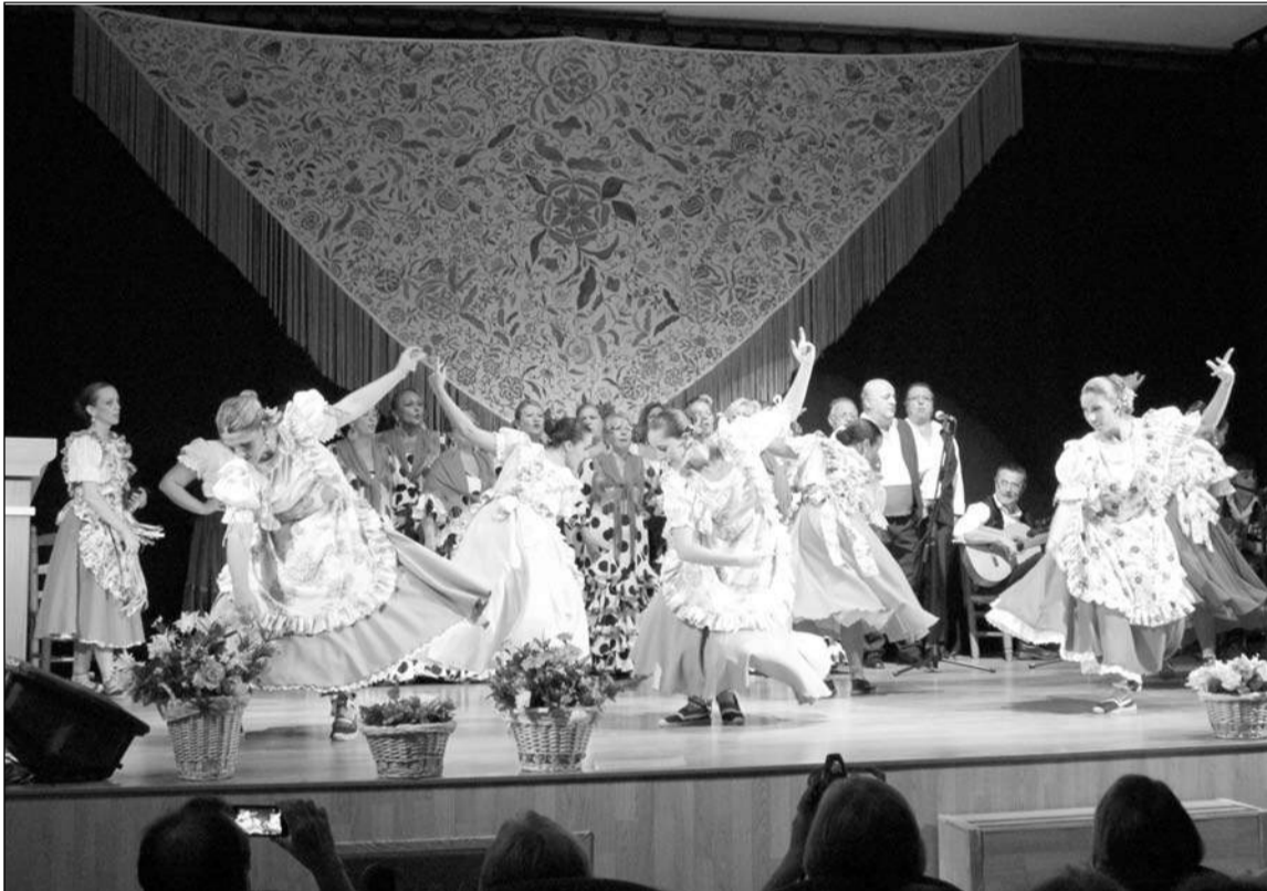
Folclore andaluz en la XI Muestra.