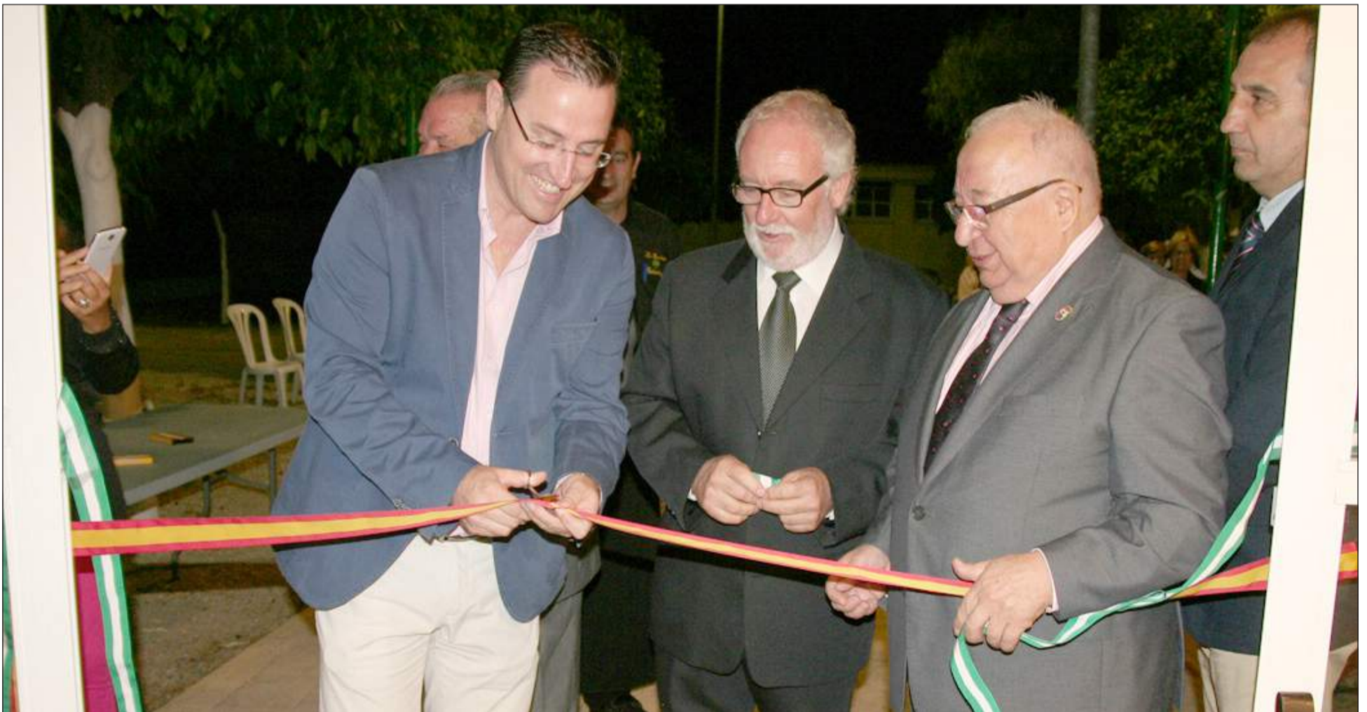
Corte de la cinta por parte del alcalde, en presencia del presidente de la entidad y el de la Federación Malagueña de Peñas.