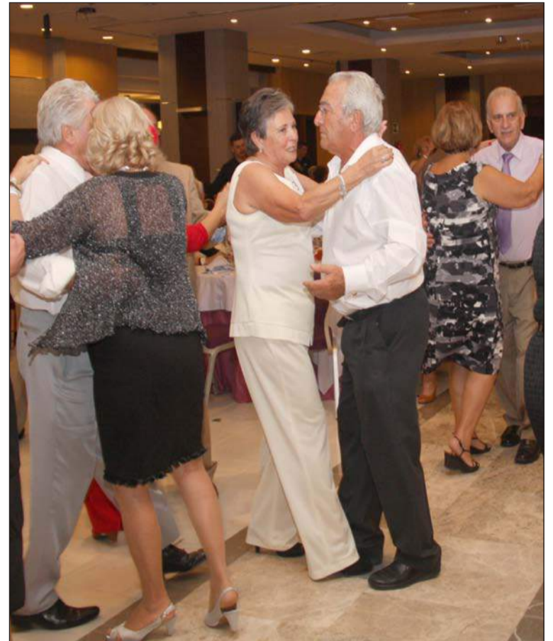
El concurso de pasodobles es una de las actividades tradicionales.