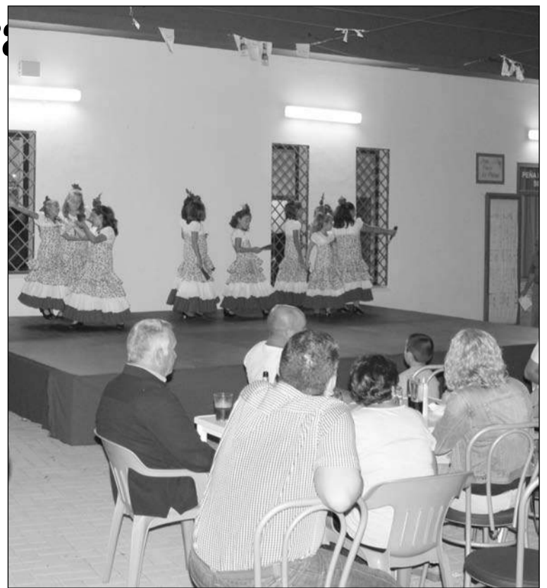
Numerosos socios disfrutaron de la actuación del grupo de baile.