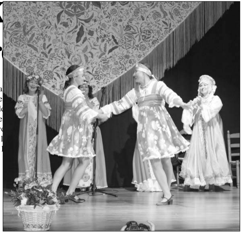
Actuación del Grupo Karinka.

músicas del mundo como símbolos de paz y amistad entre los pueblos. Posteriormente se intercambiaron obsequios.