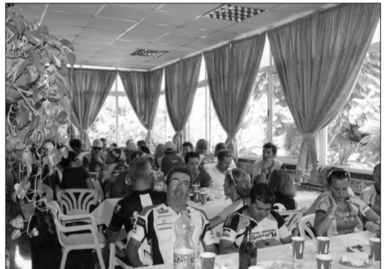
Aspecto que presentaba la sede tras la prueba deportiva.