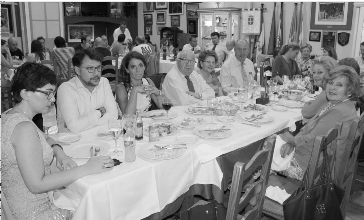
Representantes de la federación Malagueña de Peñas en la cena celebrada en homenaje al pregonero del Día de Asturias.