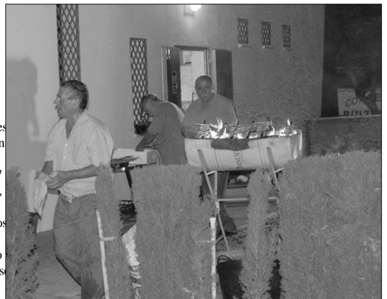
Preparativos de los espetos.