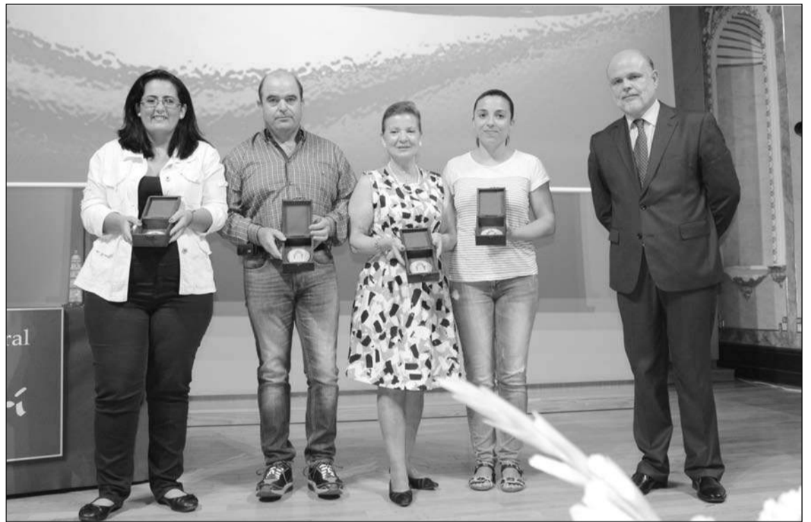
Distinciones entregadas por el presidente de Zegrí durante su XII Aniversario.