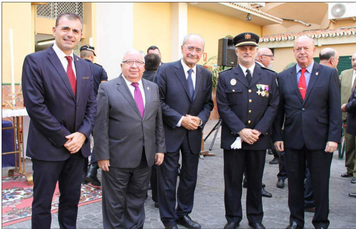
El Ayuntamiento de Málaga estuvo representado por el alcalde, Francisco de la Torre.