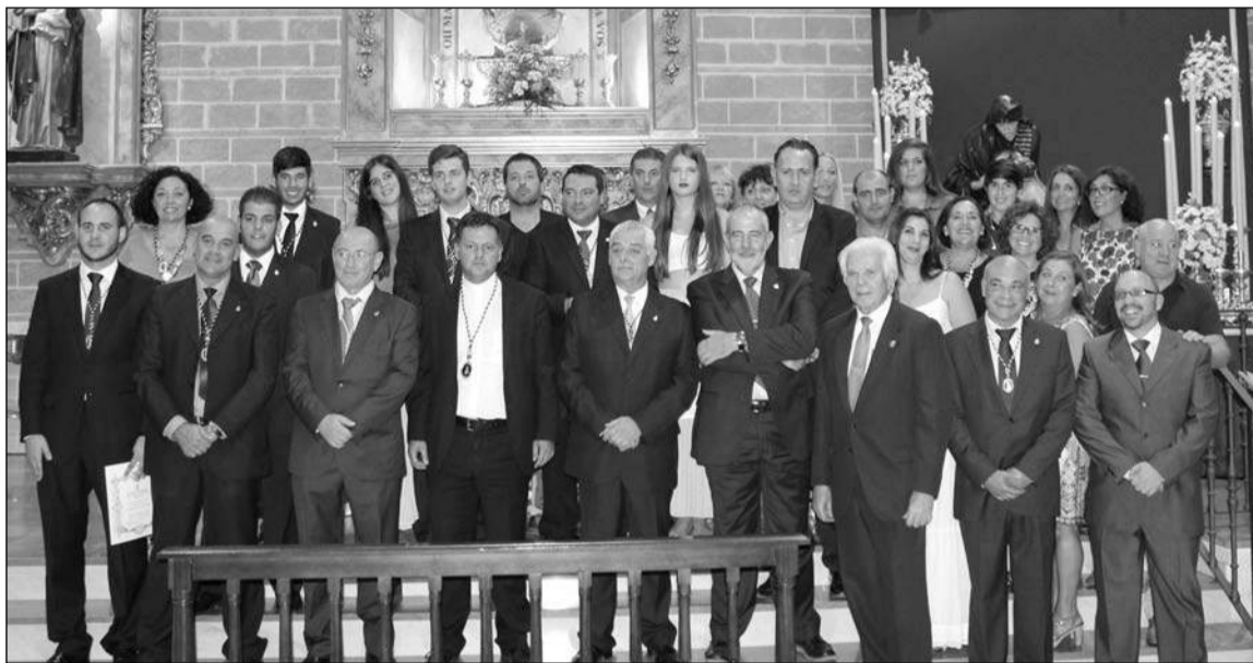
Representantes de la Federación, con cofrades de esta hermandad.