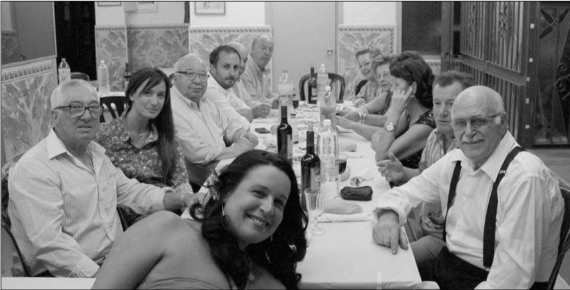
Mesa presidencial, con representantes municipales, de la Peña Nueva Málaga y la Federación de Peñas.