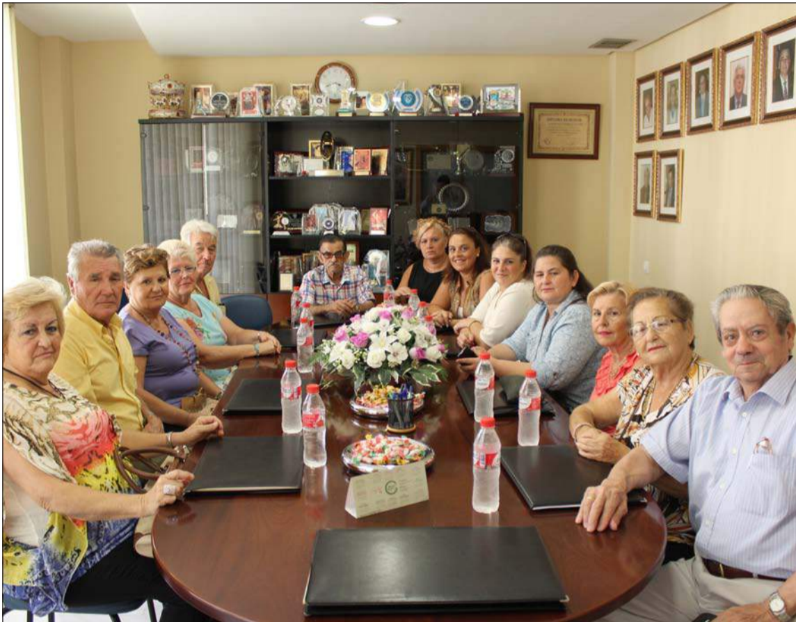
Representantes de la Peña Costa del Sol en la sala de juntas de la Federación Malagueña de Peñas.