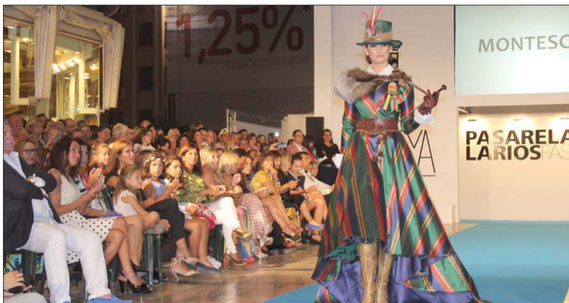
Elegancia en uno de los modelos de Montesco.

Si el viernes los modelos simbolizaban la costura artesanal, hecha a medida y personalizada, el viernes llegó el turno de la moda como comercio, como industria destinada a llevar a los ciudadanos las últimas tendencias. Para ello se contó con la participación de Gisela, Mc Gregor, Mario Teo, Spagnolo, La Gioconda, Río de la Plata, L'Etude Lingerie, Sena Design, Aulon Fashion y El Corte Inglés (Tintoretto, Síntesis, Elogy, Amitié y Emidio Tucci colección Black).