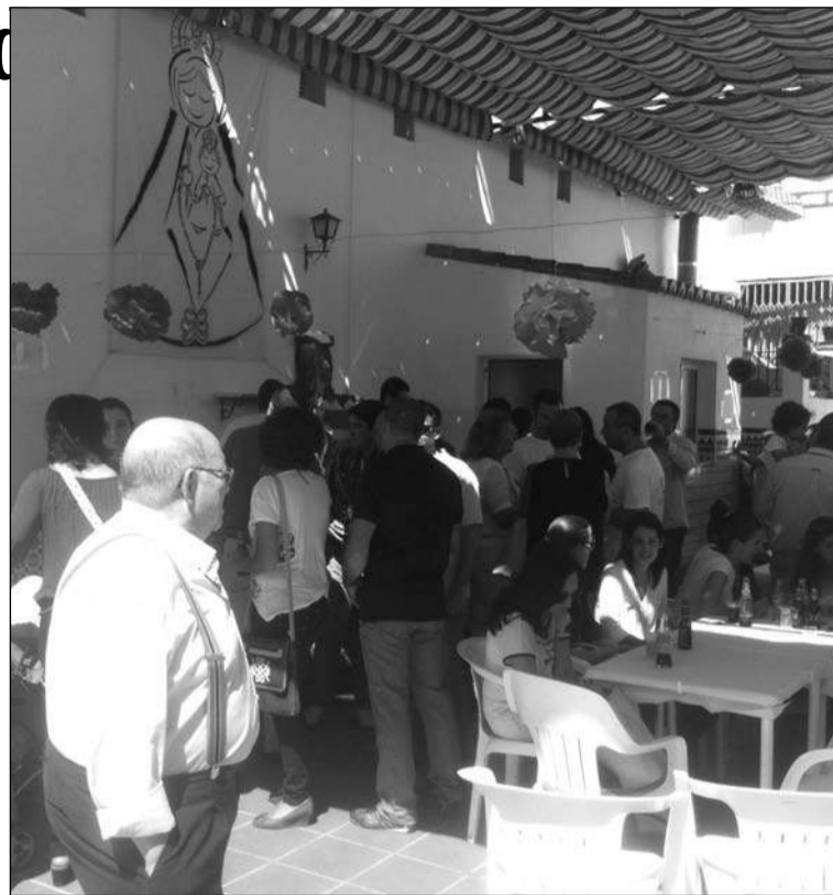
Ambiente que se vivía en el patio de la Sociedad Excursionista Antequerana.