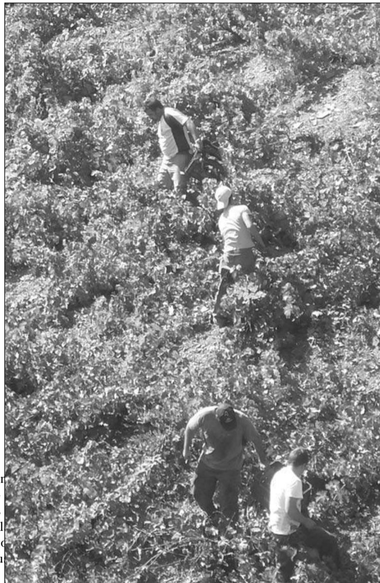
Vendimia en los Montes de Málaga.