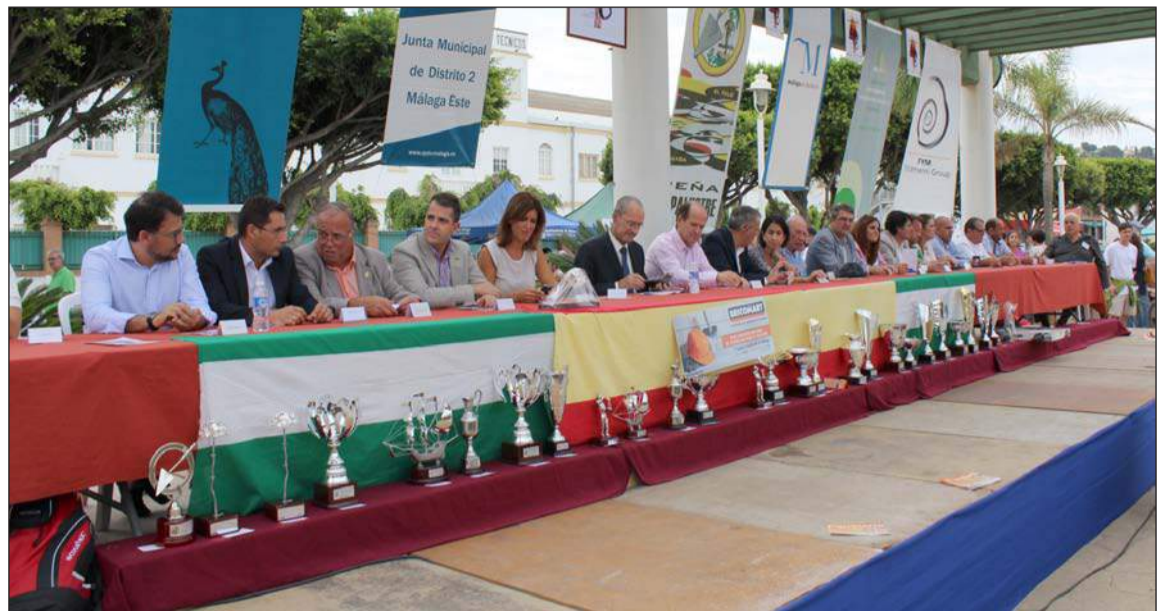
Mesa presidencial durante la entrega de trofeos.

A la finalización del concurso, en el patio central de este centro