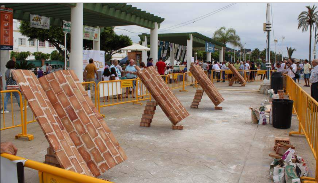
Algunos de los trabajos de albañilería realizados en la plaza del Padre Ciganda.

En fechas próximas se comunicará la forma que van a tener las diferentes entidades federadas de inscribir a sus representantes en una de las actividades más entrañables de cuantas se organizan a lo largo del año.