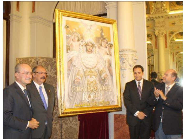
Momento en que se descubre el cartel.

tas exposiciones colectivas desde 1996, destacando Barcelona, Nueva York (EEUU) y Nimes (Francia). En el 2011 recibe el premio Juventud Cofrade de Onda Azul y en 2012 el galardón Pintor del Año, concedido por la Asociación de Escritores de Málaga.