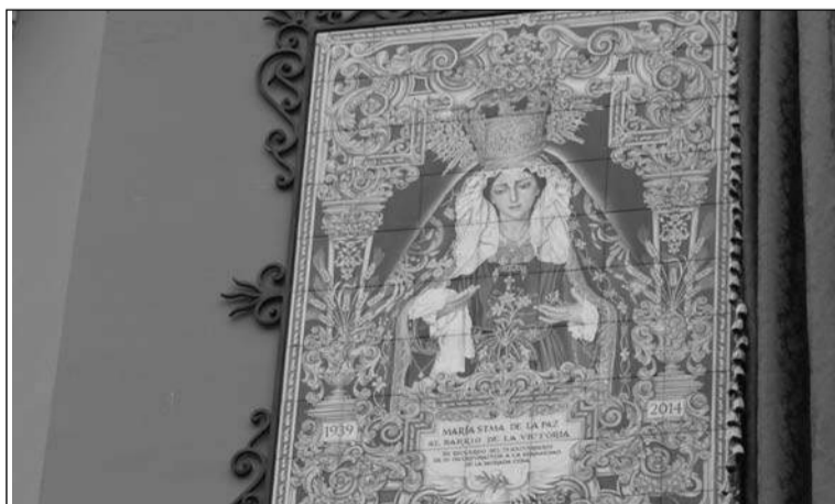
Detalle de la pieza cerámica.