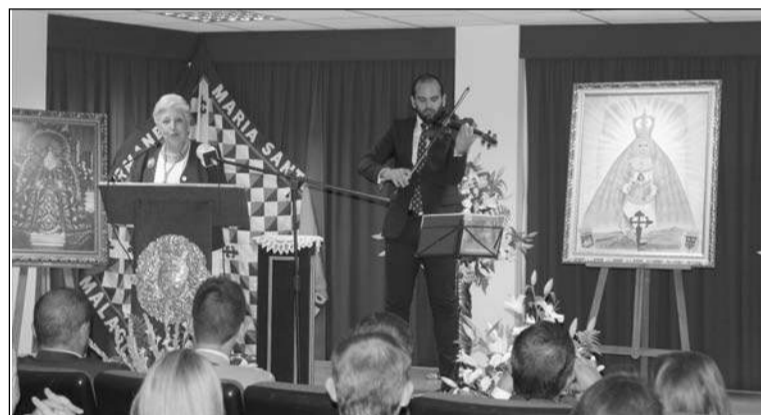
Pregón en honor a la Virgen de la Sierra.