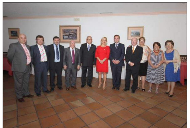
Representantes municipales, de la entidad, de la Federación y de otras peñas.