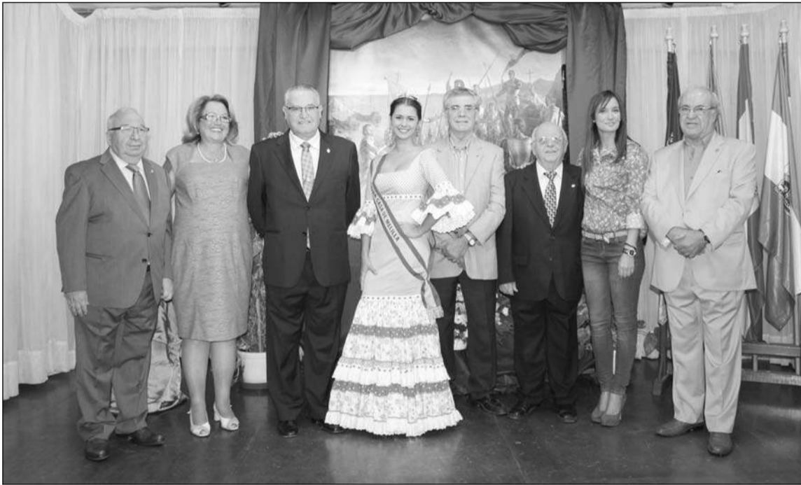
La Reina de la Casa de Melilla, con algunos de los asistentes a este evento.