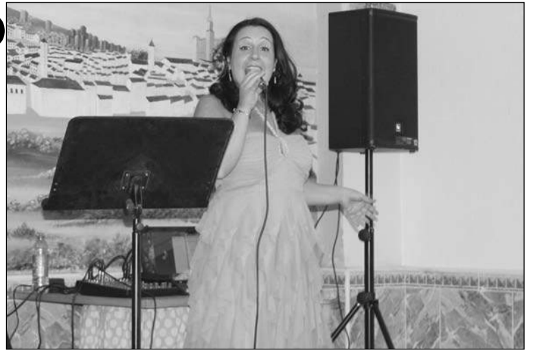
Se contó con una actuación musical en directo.