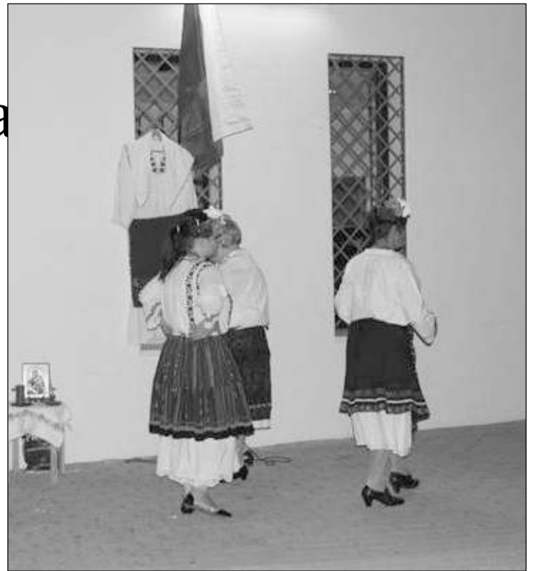
Bailes tradicionales de Bulgaria.