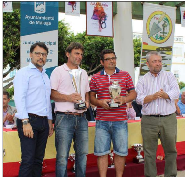
El presidente adjunto de la Federación, a la izquierda, entrega un premio.