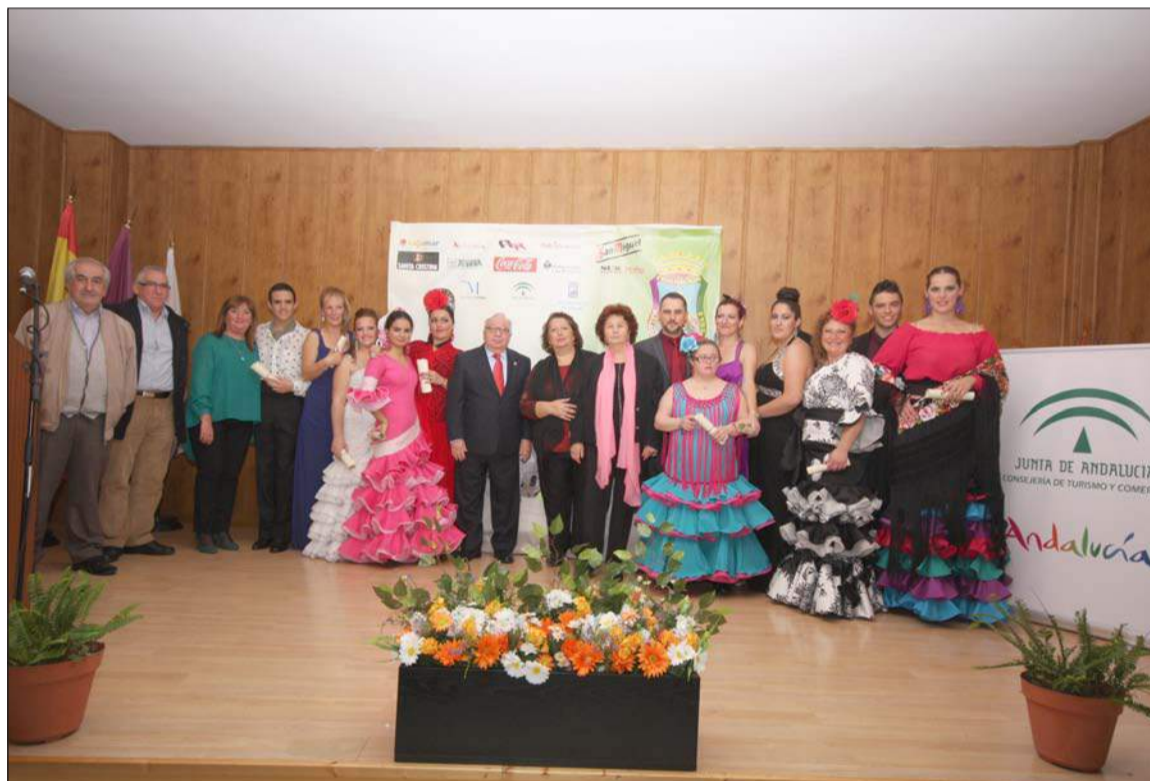
Clausura de la Escuela de Copla en 2013.

Las particulares características de la Escuela de Copla 'Miguel de los Reyes', marcadas fundamentalmente por su personalización, calidad y gratuidad, la han convertido en referente de la formación musical en nuestra capital.