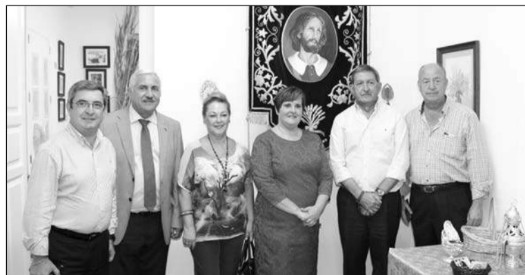
Inauguración de la exposición.