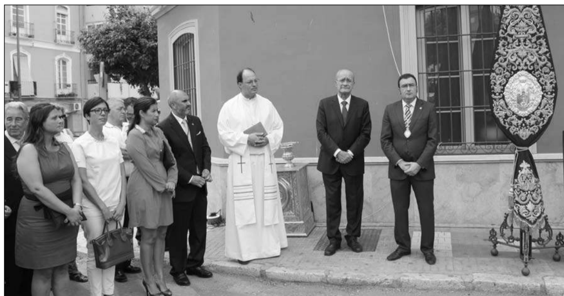
Acto de bendición del mosaico.