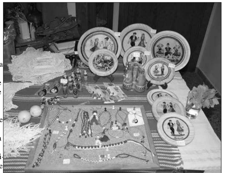
Muestra de artesanía búlgara.