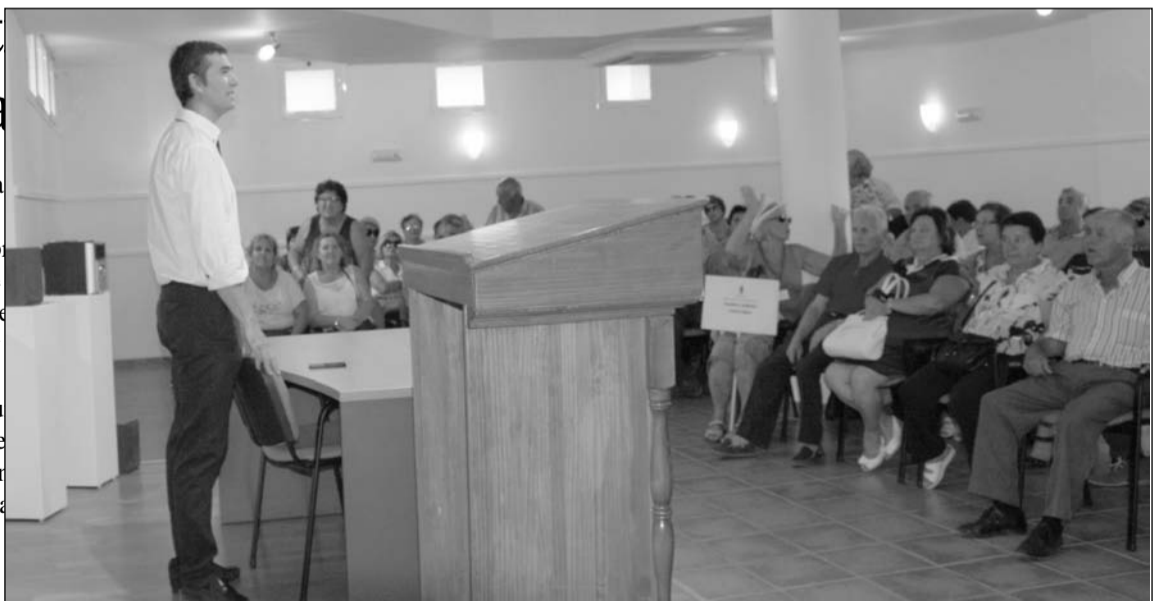
El encuentro de peñas flamencas coincidió con la Noche del Vino de Cómpe

Unos días después, el miércoles 17, se realizó una excursión a Castilla León en tren del CD y DVD sobre los cantautores de Málaga en cuyo hotel de Valladolid. Se visitó también Segovia, Salamanca, Miranda de Duero, Olmedo, Palencia y Ávila.