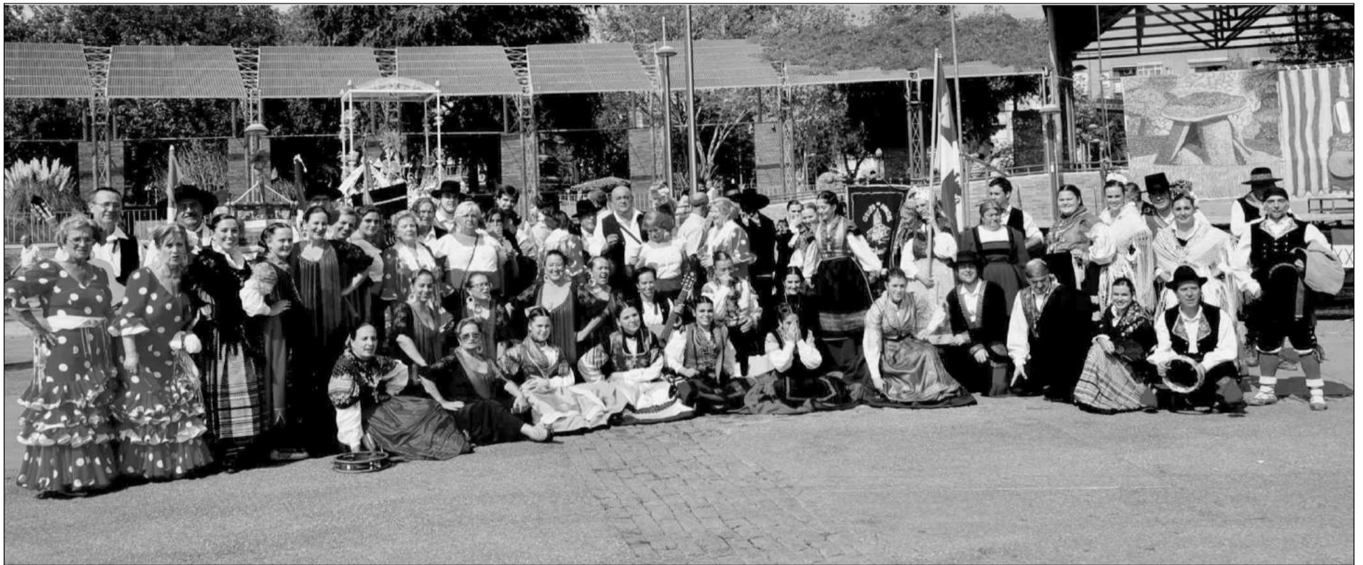
Componentes de Raíces y Horizonte, junto a los de otras de las agrupaciones participantes en el Encuentro de Leganés.

Estas actividades cierran un verano cargado de actividades para esta entidad perteneciente a la Federación Malagueña de Peñas, Centros Culturales y Casas Regionales 'La Alcazaba'.