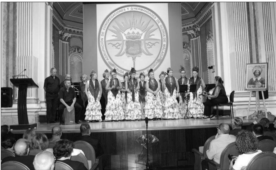
Uno de los coros participantes en el certamen.