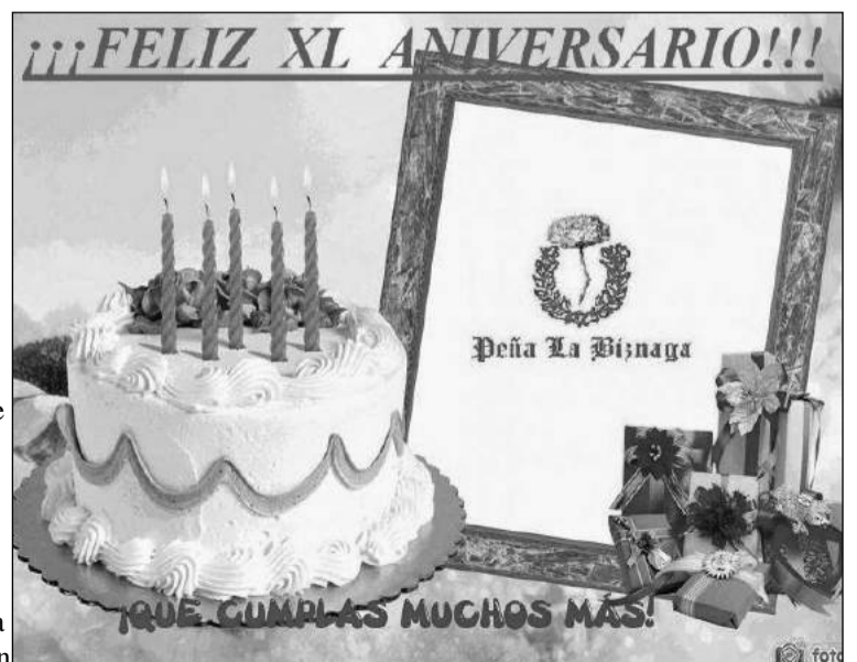
Felicitación elaborada por la Peña La Biznaga para sus socios.

21 de septiembre de 1974, esto fue la fecha de inicio de un proyecto, de un sueño, de una peña de amigos... El pasado 21 de septiembre de 2014 se cumplieron sus 40 años de andadura perteneciente a la Federación Malagueña de Peñas, Centros Culturales y Casas Regionales. Por eso, desde el pasado 4 de octubre se quiere felicitar a los hombres y mujeres de esta entidad.