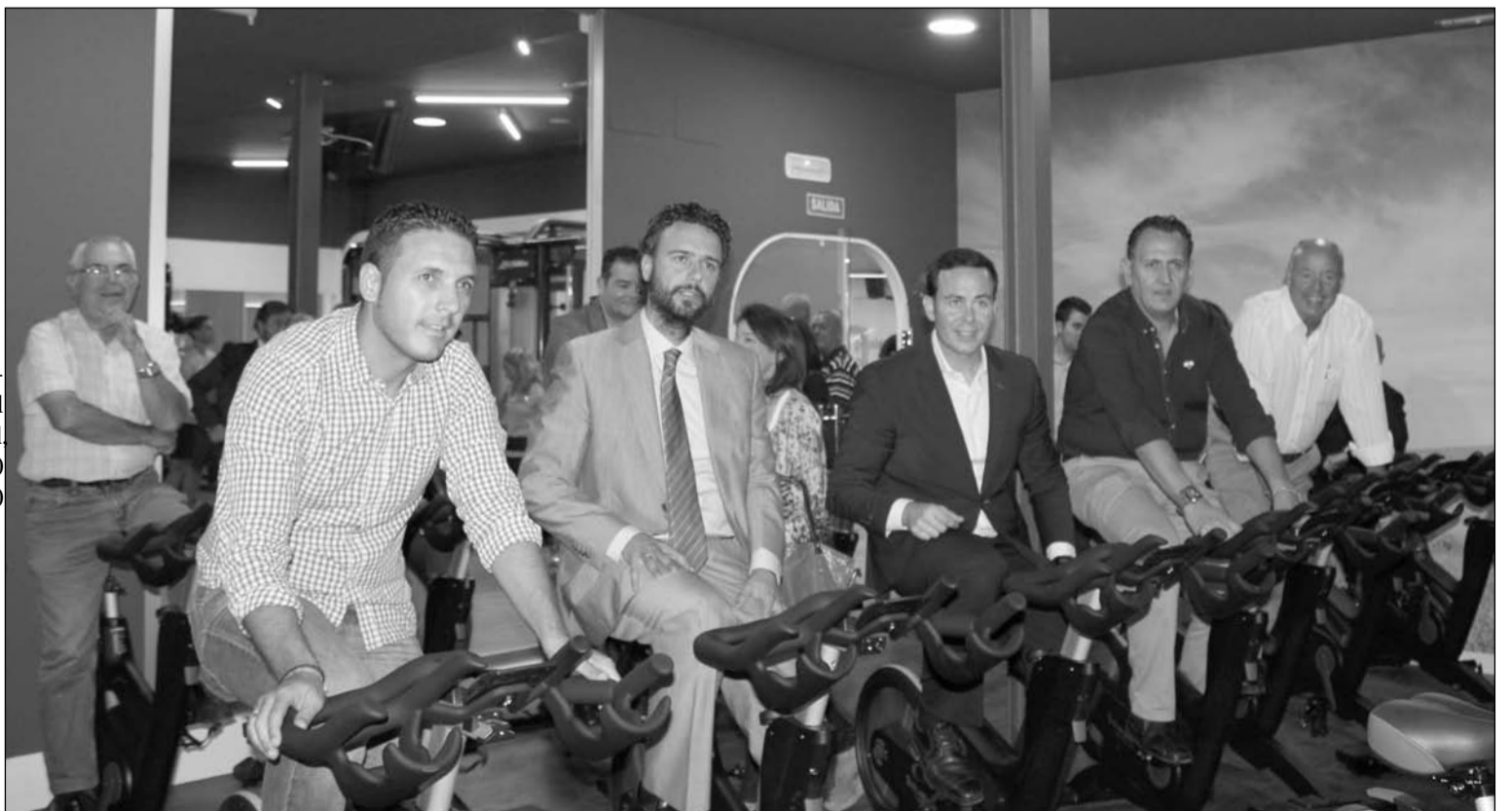
Primera clase de spinning que se impartió en Synergym.