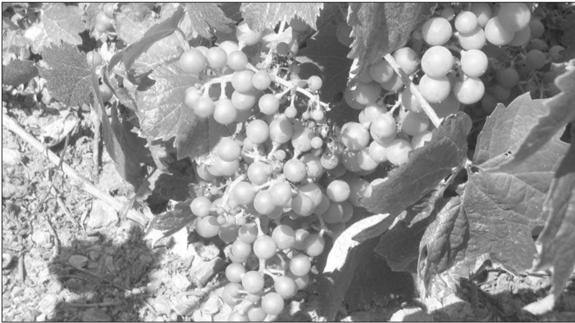
Magnífico racimo de uva Moscatel en un viñado de los Montes de Málaga.