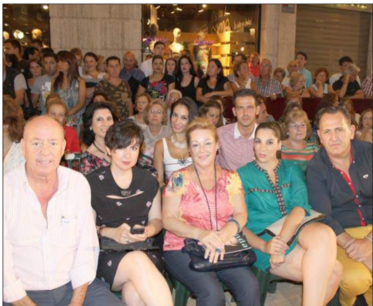
Directivos de la Federación de Peñas presenciando el pase de moda.