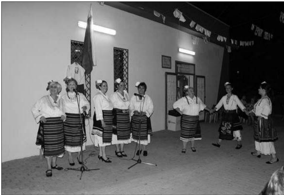
Un instante de la actuación del grupo de folclore búlgaro.