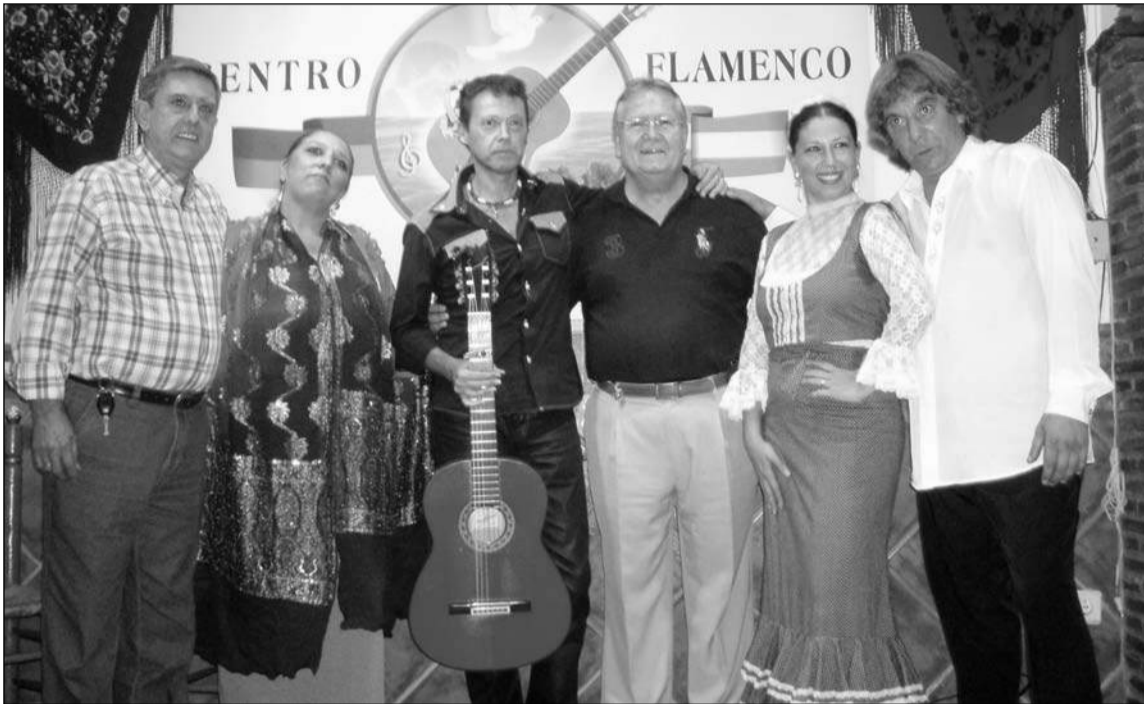
Miembros de la entidad con componentes del grupo.