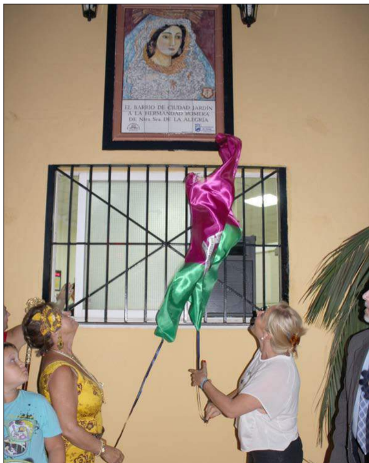
Instante en que se descubre el mosaico.