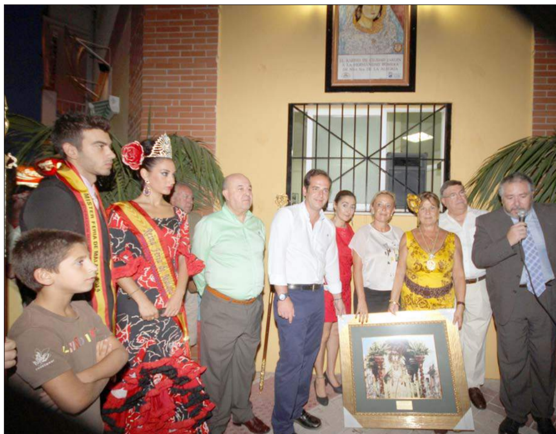
Acto de inauguración del mosaico en honor de la Virgen de la Alegría.

Por la tarde, a las 19 horas, se cantaba la Salve para emprender camino de regreso a su templo. Como durante todo el fin de semana, la Hermandad estuvo muy acompañada por fieles y devotos, entre los que se