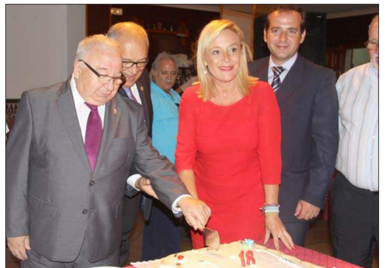
Instante en el que se procede a cortar la tarta.