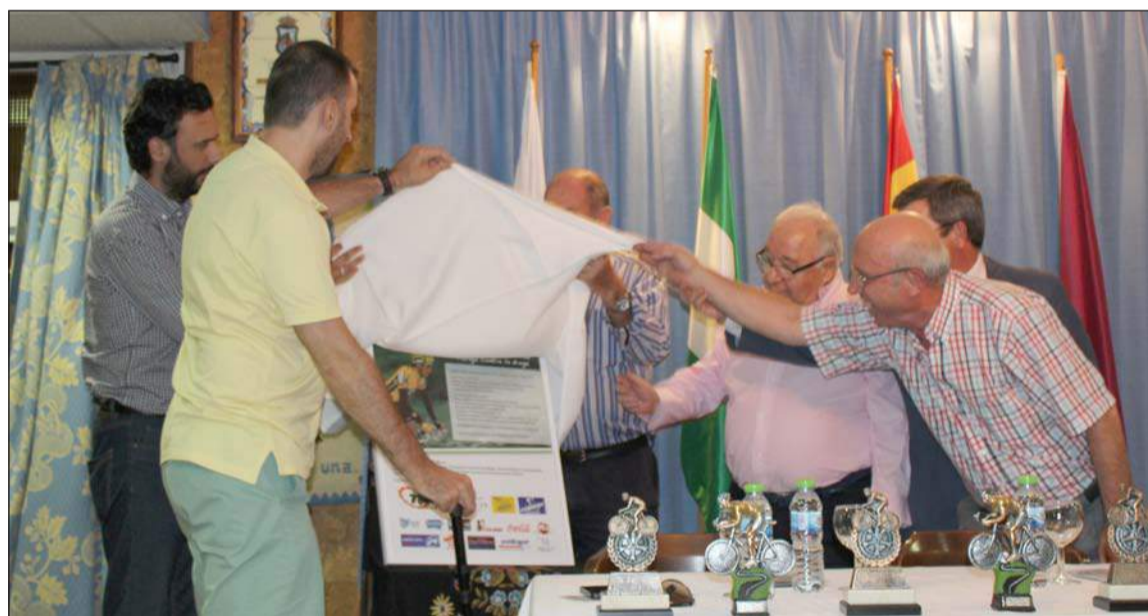
Instante en el que se descubre el cartel de la prueba.