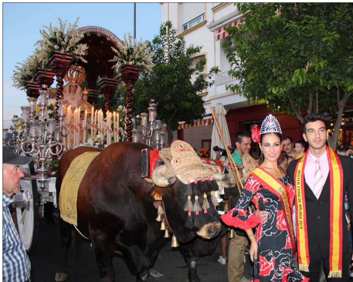
La Reina y el Mister de la Feria, ante la carreta de la Virgen de la Alegría.