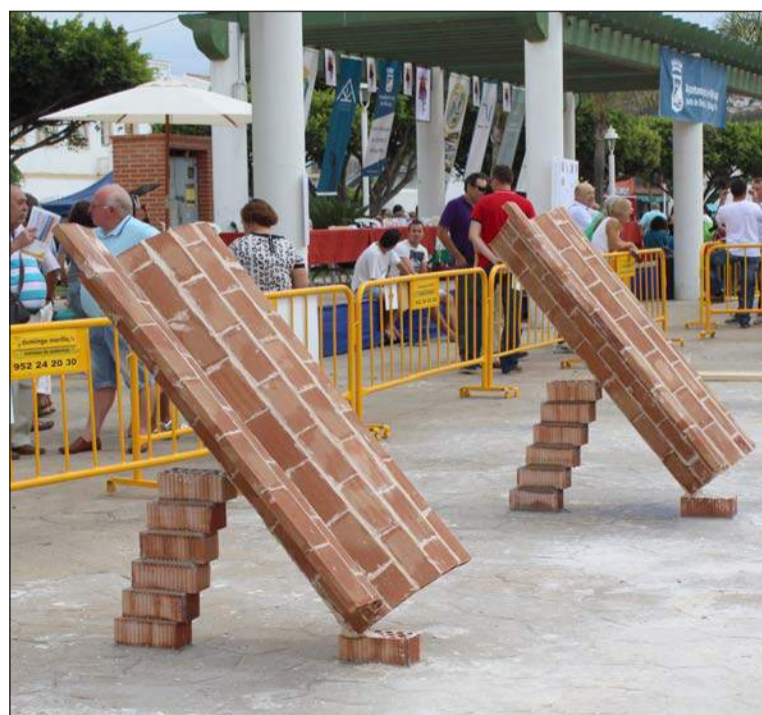
Ejercicio propuesto, ya concluido.