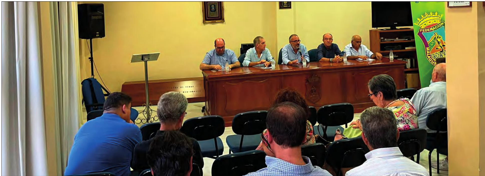
Vista general del salón de actos de la Federación durante la Tertulia Taurina del 1 de septiembre.

Este ciclo de Tertulias Taurinas se ha celebrado con el patrocinio de la Diputación Provincial de Málaga, y en colaboración con www.malagataurina.es .