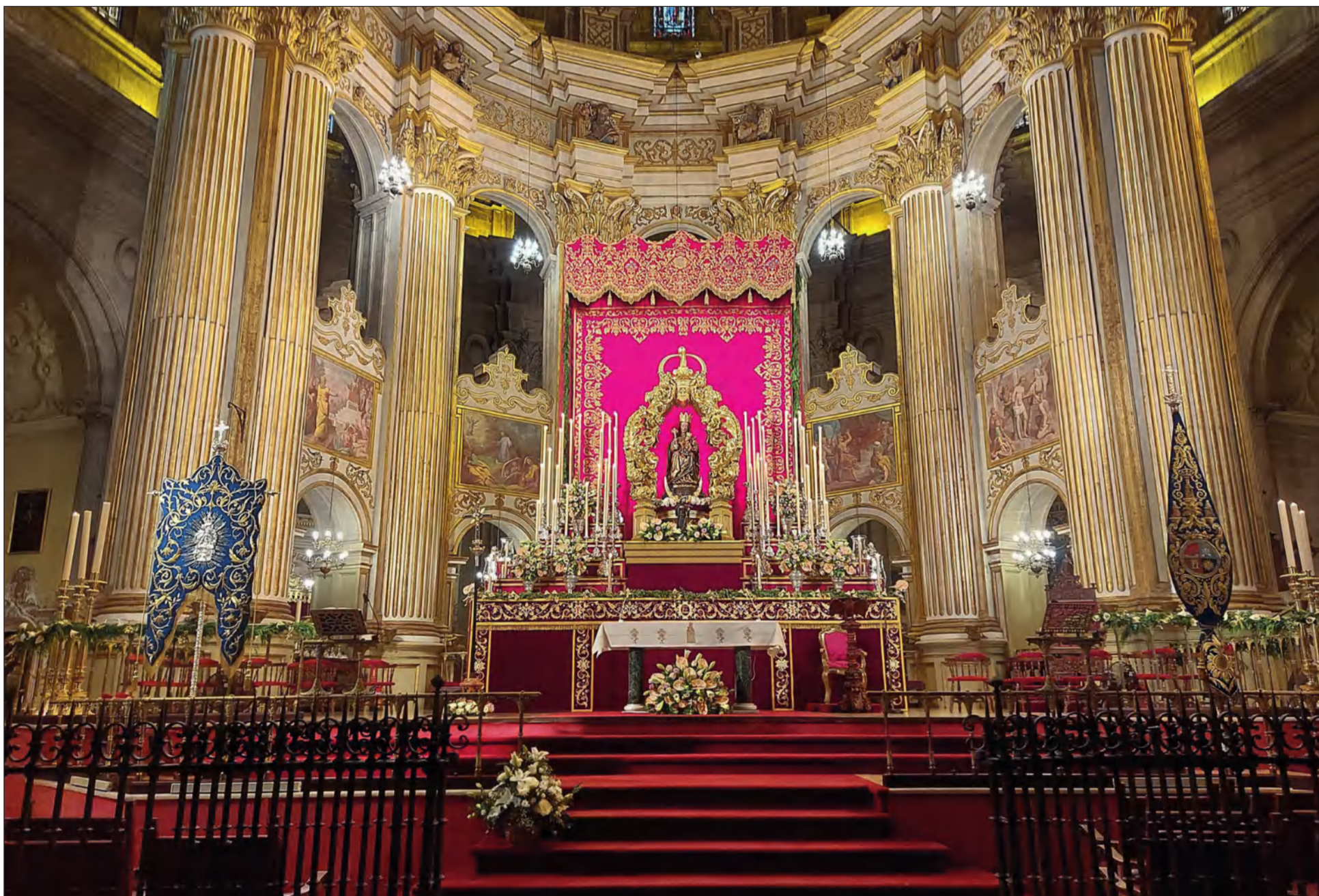
Santa María de la Victoria, en el Altar Mayor de la Catedral para su Solemne Novena.

• FEDERACIÓN MALAGUEÑA DE PEÑAS, CENTROS CULTURALES Y CASAS REGIONALES 'LA ALCAZABA'