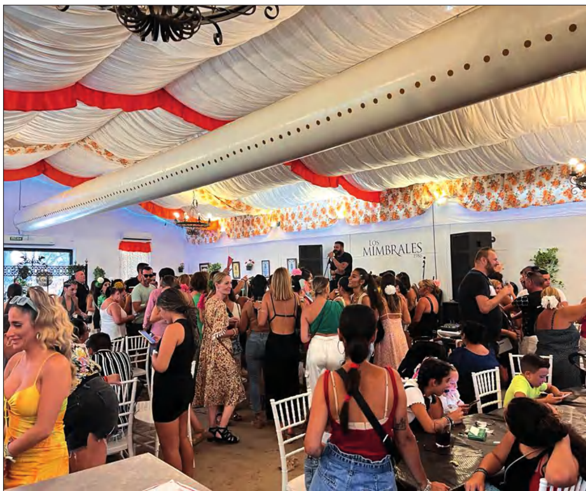
Vista general de la Caseta de Los Mimbrales.