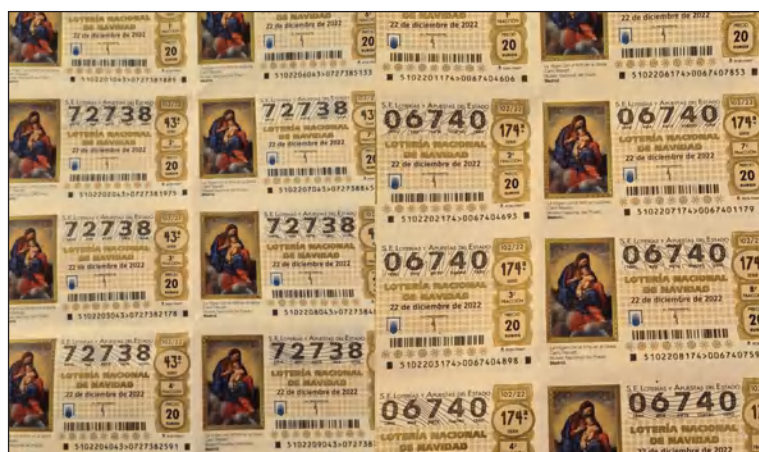
Décimos que juega la Federación en 2022.

En esta ocasión, se cuenta con dos números, el 72738 y 06740; que pueden retirarse poniéndose en contacto a través del 952 60 33 43 (preguntar por Sol).