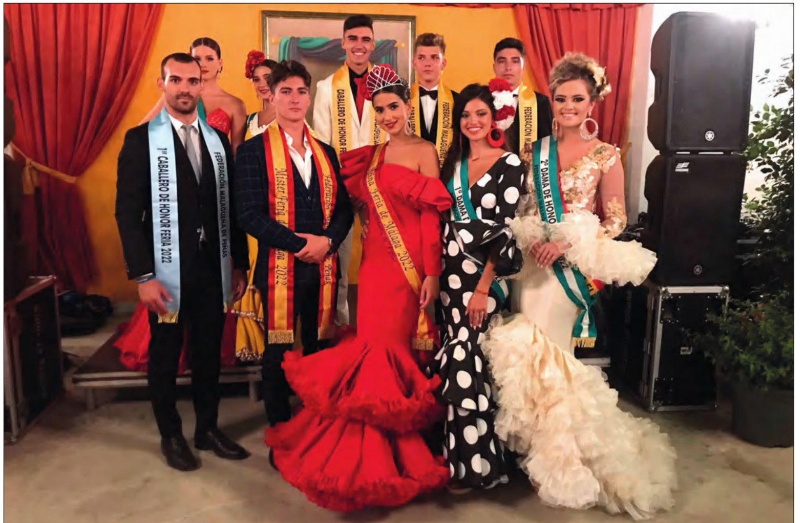
Reinas y Mister regresan este 2022 a la Catedral para realizar una Ofrenda Floral

engrandecer el paso de la Patrona de Málaga, con la que los peñistas se encuentran tras estrechamente vinculados desde hace décadas y a la que cada año veneran durante su festividad.