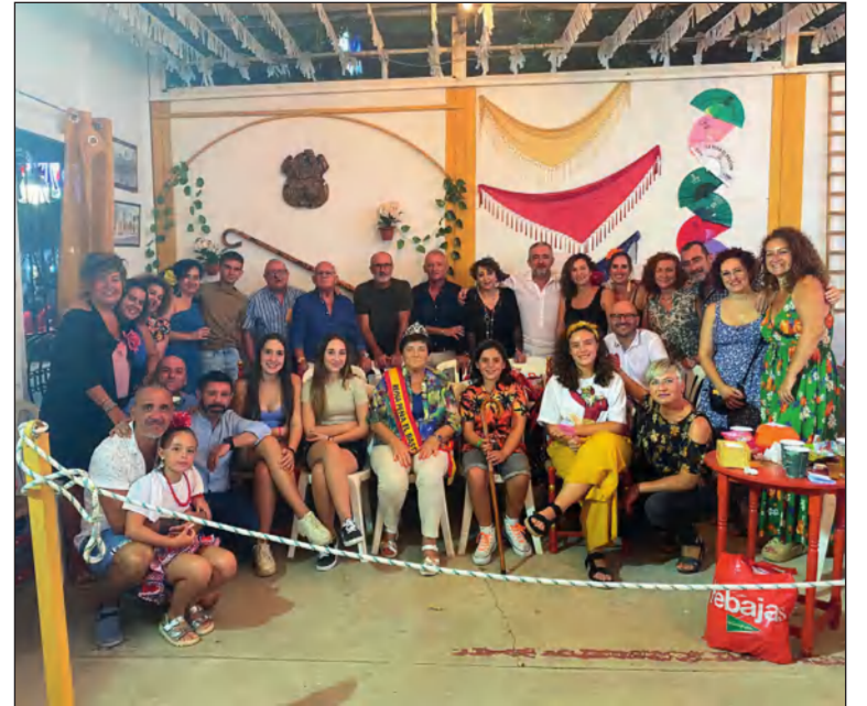
Componentes de la entidad en la jornada de elección de Reinas y Bastoneros,

Reinas y los Bastoneros de la peña, tanto infantil como adultos, que tuvo lugar el viernes día 19.