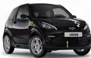
COCHES SIN CARNET