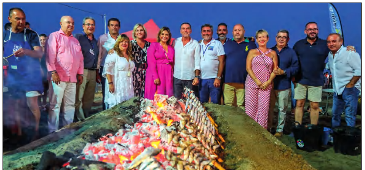
Asistentes al acto celebrado en la playa de La Carihuela.