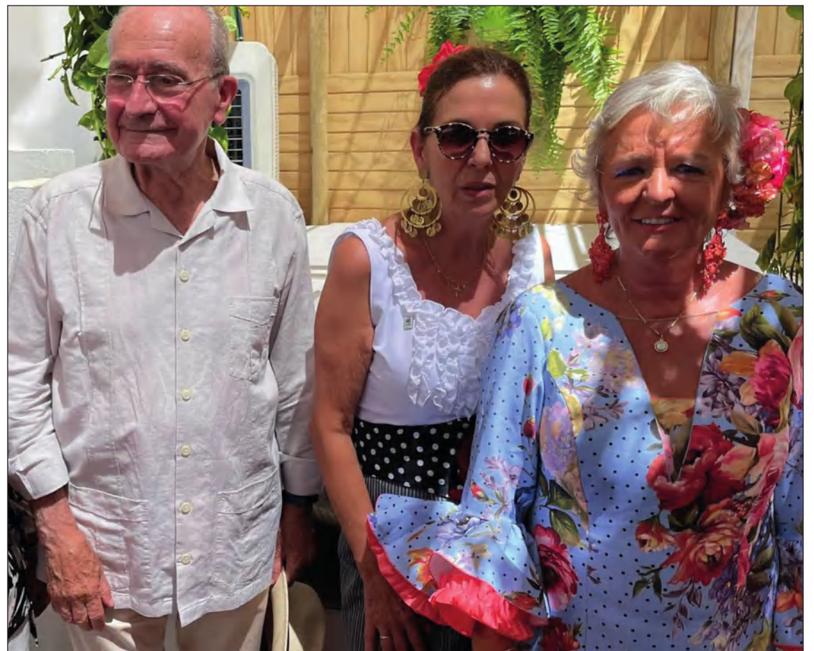
La presidenta de la entidad, con el alcalde Francisco de la Torre y la teniente de alcalde Teresa Porras.