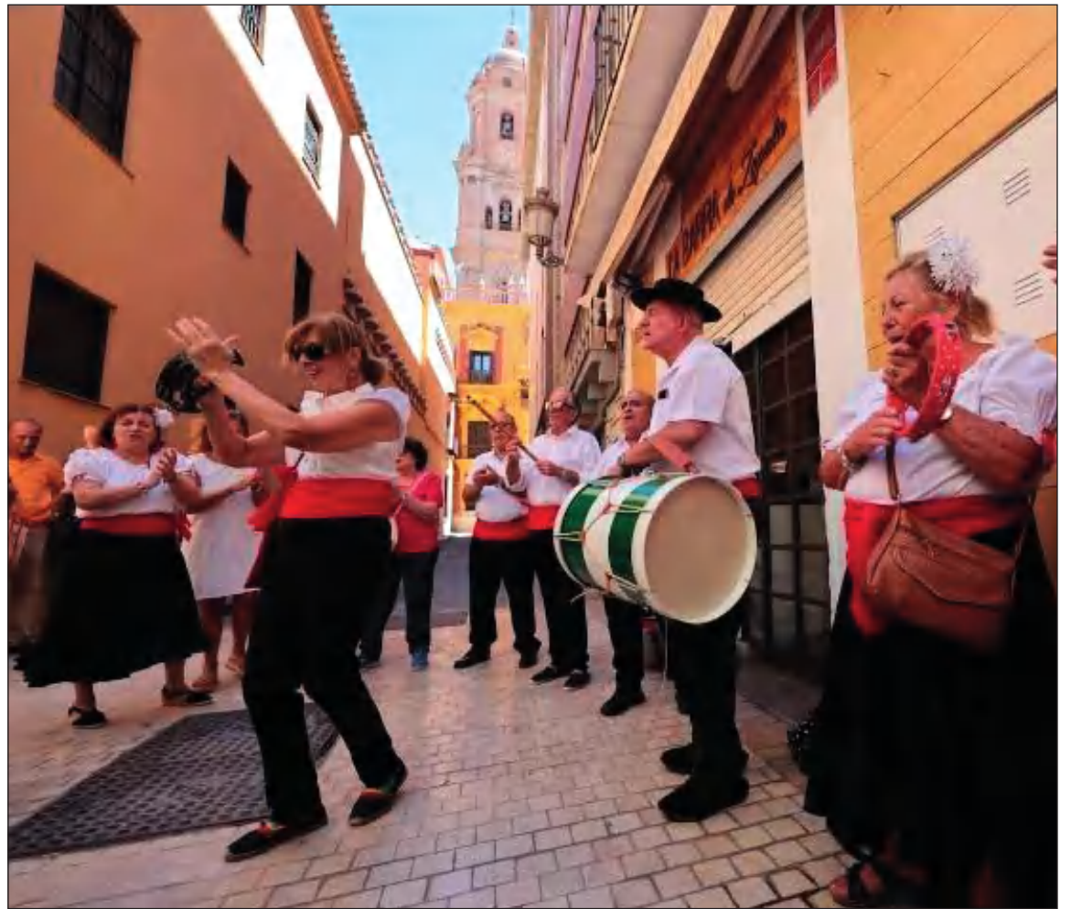
Cante y baile en el Centro Histórico.

• ASOCIACIÓN DE VECINOS VICTORIANA DE CAPUCHINOS Y DE LA FUENTE