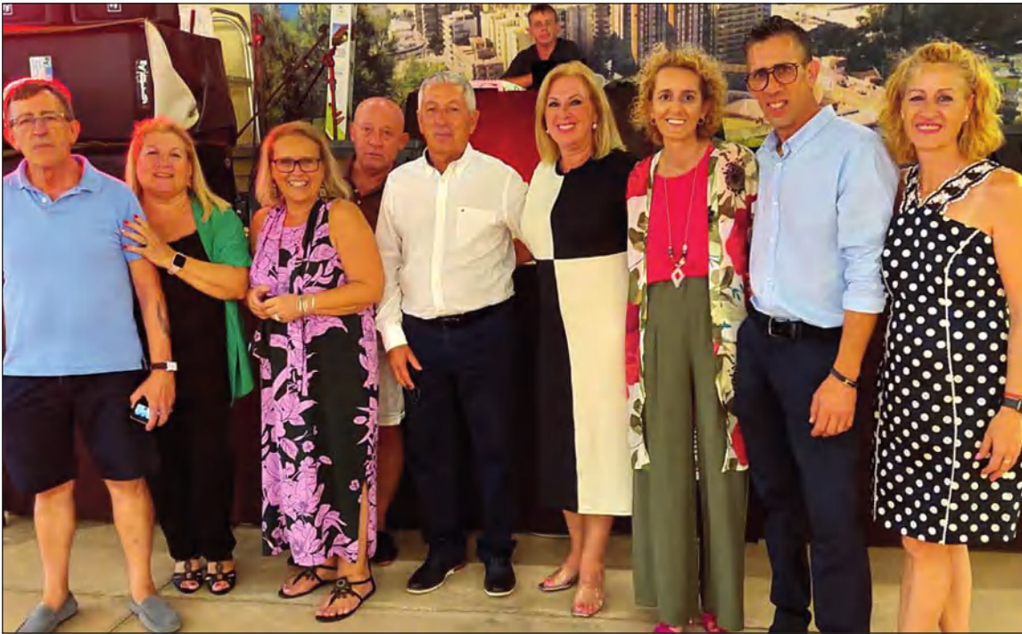
Componentes de la Peña Santa Cristina en su caseta.

A lo largo del resto de la Feria, la Caseta de la Peña Santa Cristina ha sido un lugar muy concurrido para socios, vecinos de su entorno y malagueños y visitantes en general.