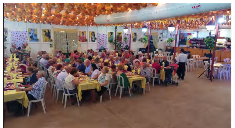
Cena de Socios.