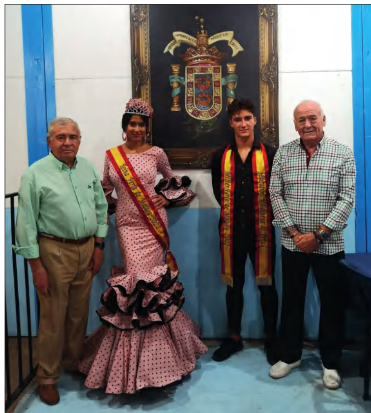
Visita de la Reina y el Míster de la Feria de Málaga.