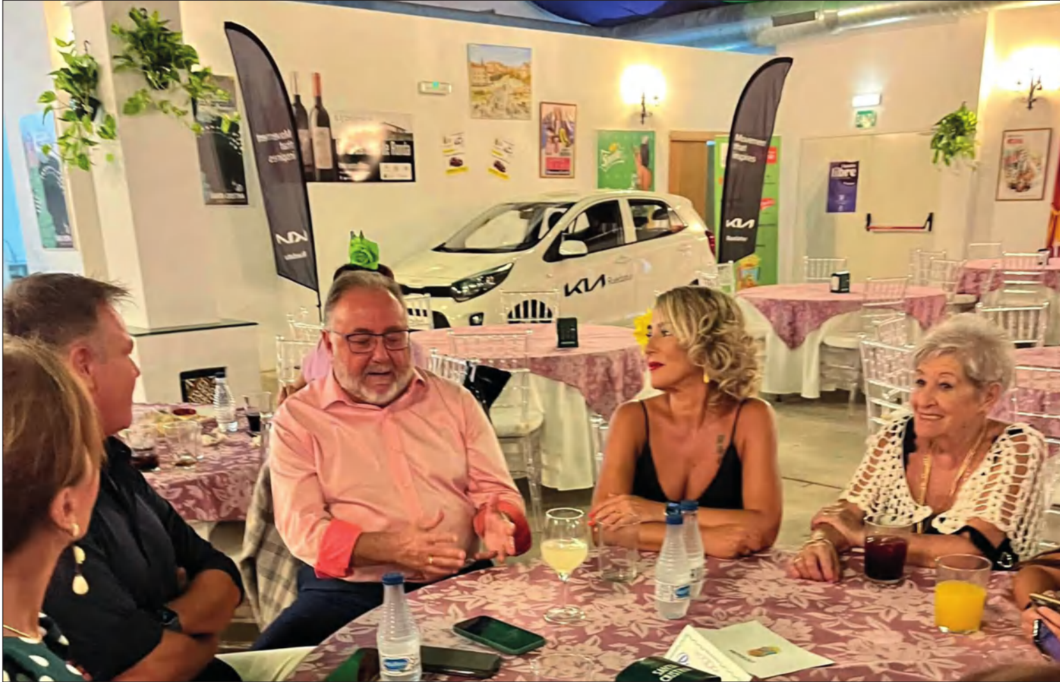
Aspecto del espacio ocupado por el KIA Picanto en la caseta, en una imagen del alcalde de Alhaurín de la Torre y miembros del jurado de Reina y Mister 2022.