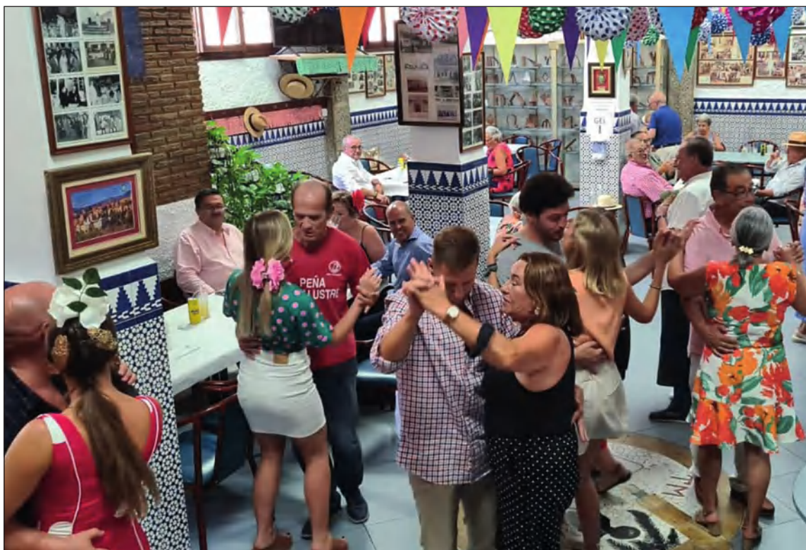
Baile en la celebración de la Feria de Málaga en la Peña El Palustre.