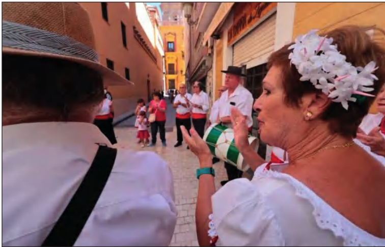
El Coro de la entidad, en las calles del Centro.

tes de la formación musical de esta entidad perteneciente a la Federación Malagueña de Peñas, Centros Culturales y Casas Regionales 'La Alcazaba' vivían el miércoles 16 la Feria del Centro.