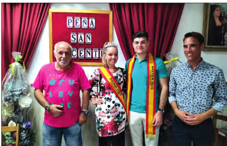
Elección de Reina y Mister.