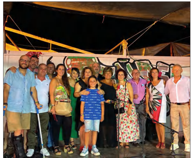
Integrantes de la junta directiva de la entidad.