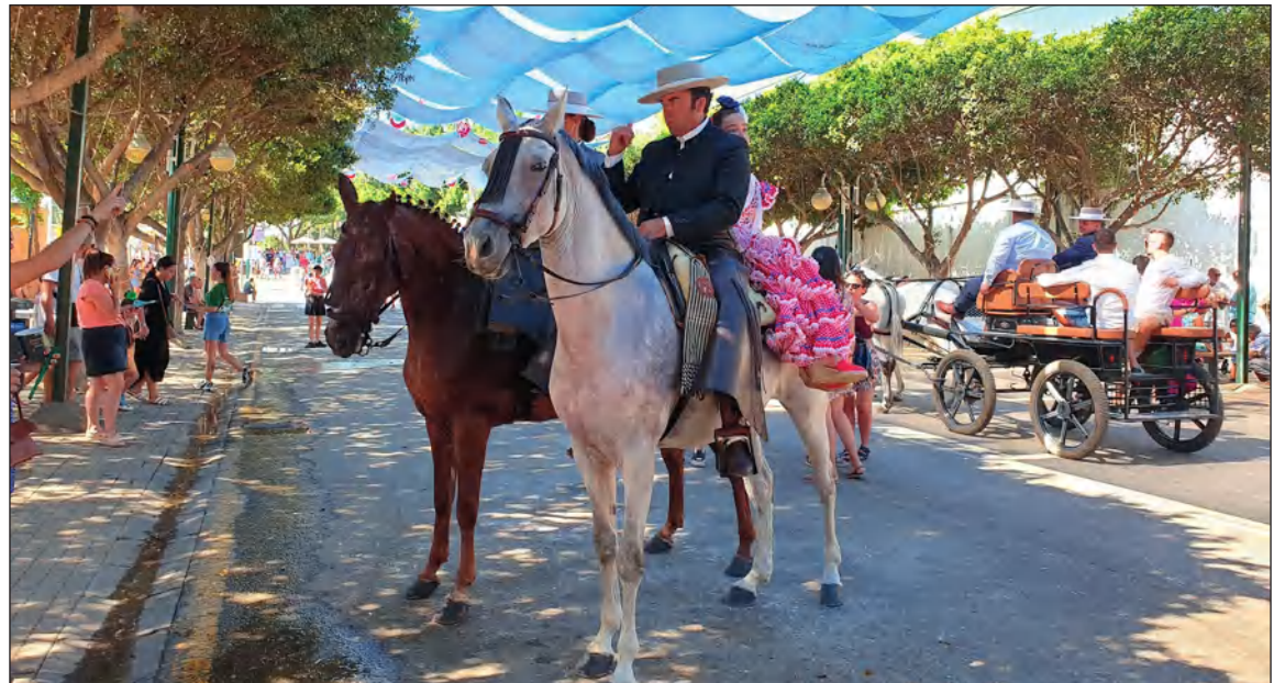
Vista del paseo de caballos en el recinto ferial de Cortijo de Torres durante el pasado mes de agosto.

Con esta actividad, comenzamos el último cuatrimestre del año, en el que aún nos esperan grandes acontecimientos de defensa de la cultura popular y las tradiciones de nuestra ciudad de Málaga y su provincia, de las que nos sentimos profundamente orgullosos y comprometidos en su mantenimiento y conservación.