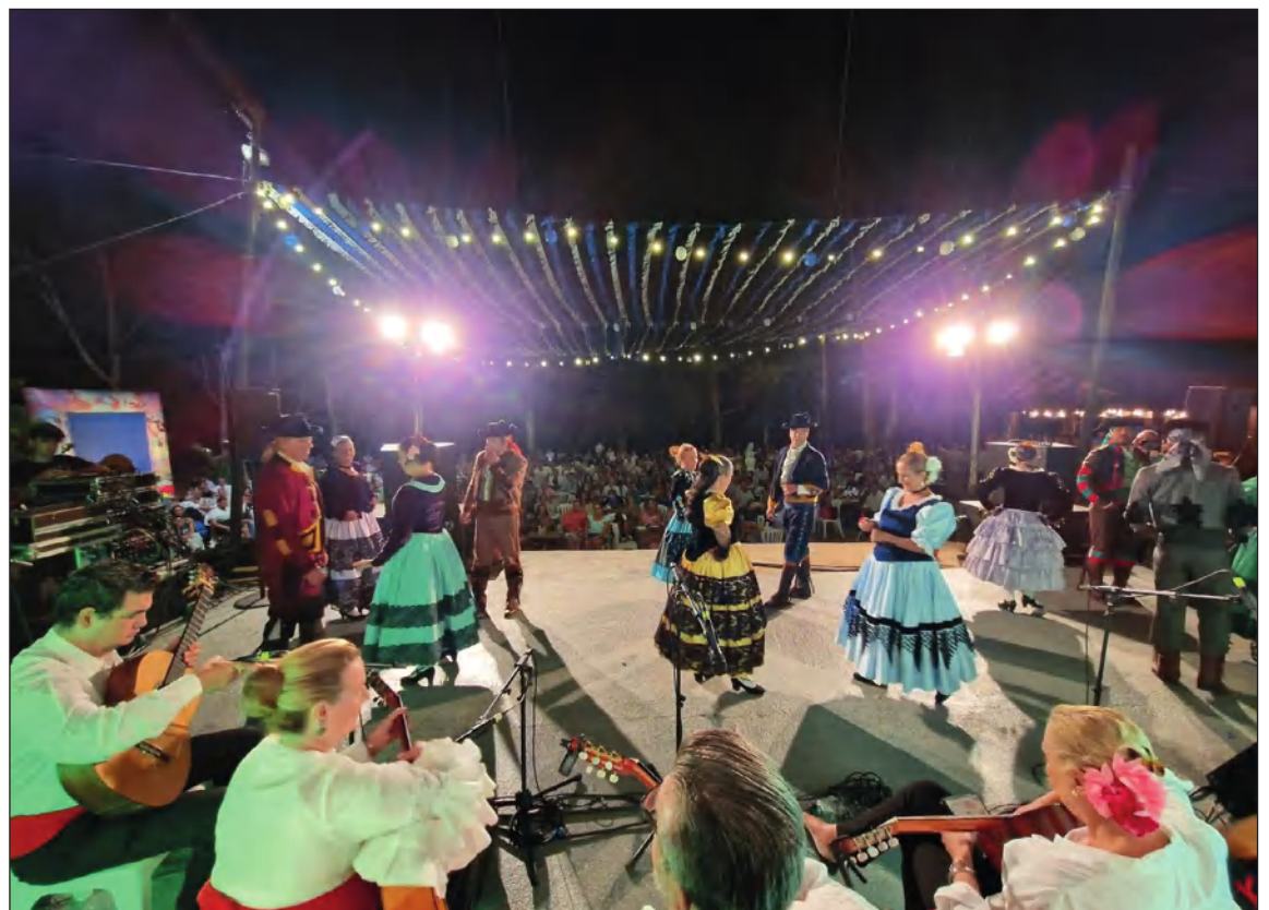
Actuación en los Fandangos del Güi, en El Morche.