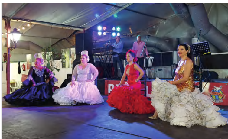
Batas de cola en Cortijo de Torres.