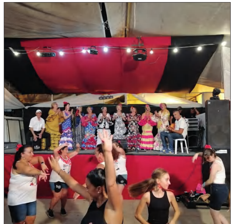
Actuación en la Feria de Málaga.