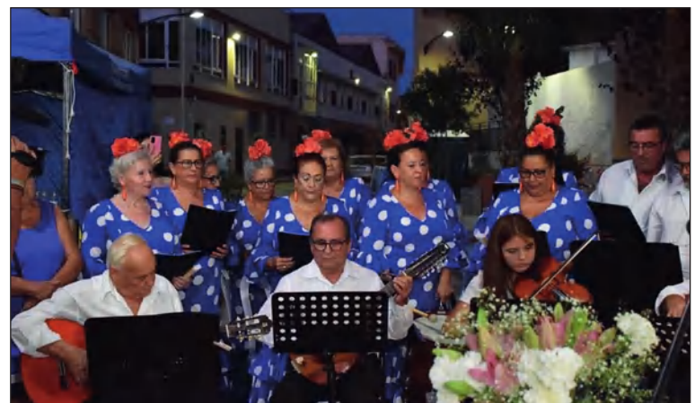
Integrantes de la asociación durante su intervención.