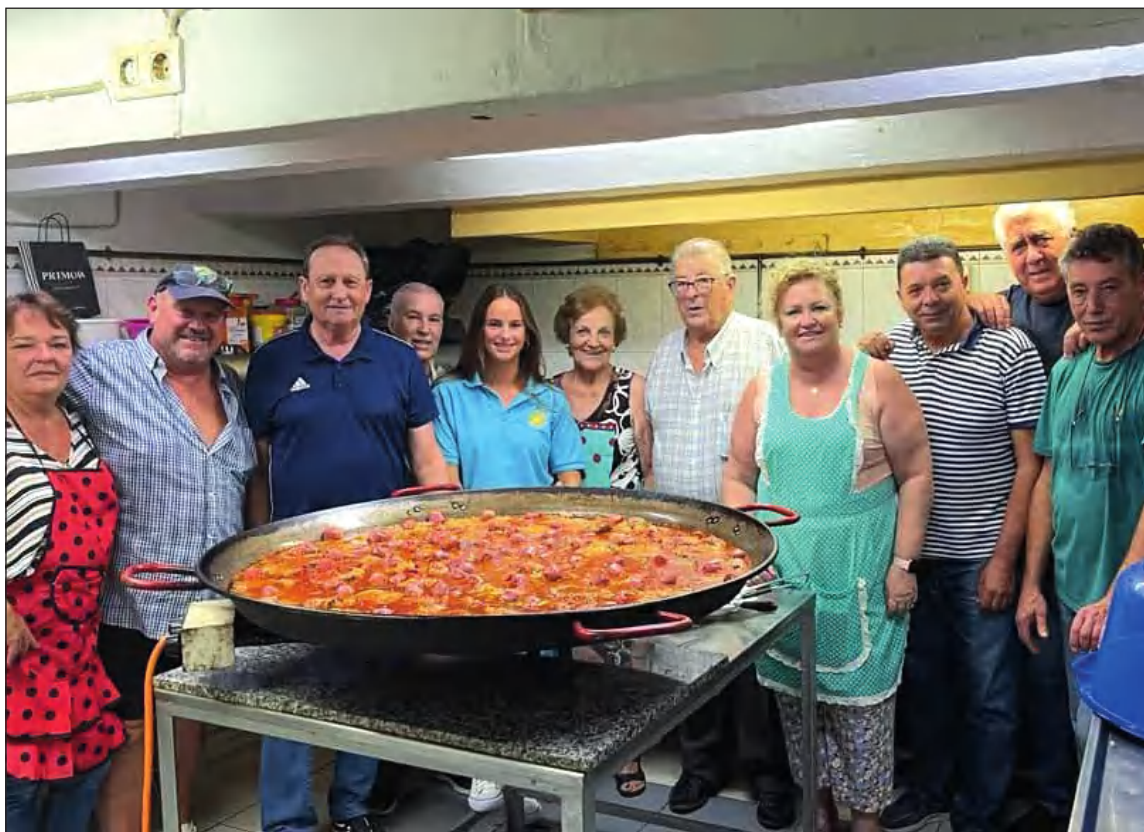
La Junta Directiva se encargó de retomar sus comidas mensuales el pasado fin de semana.

Esta comida la organizó el grupo de La Junta Directiva con su especialidad de chuletas a la riojana.