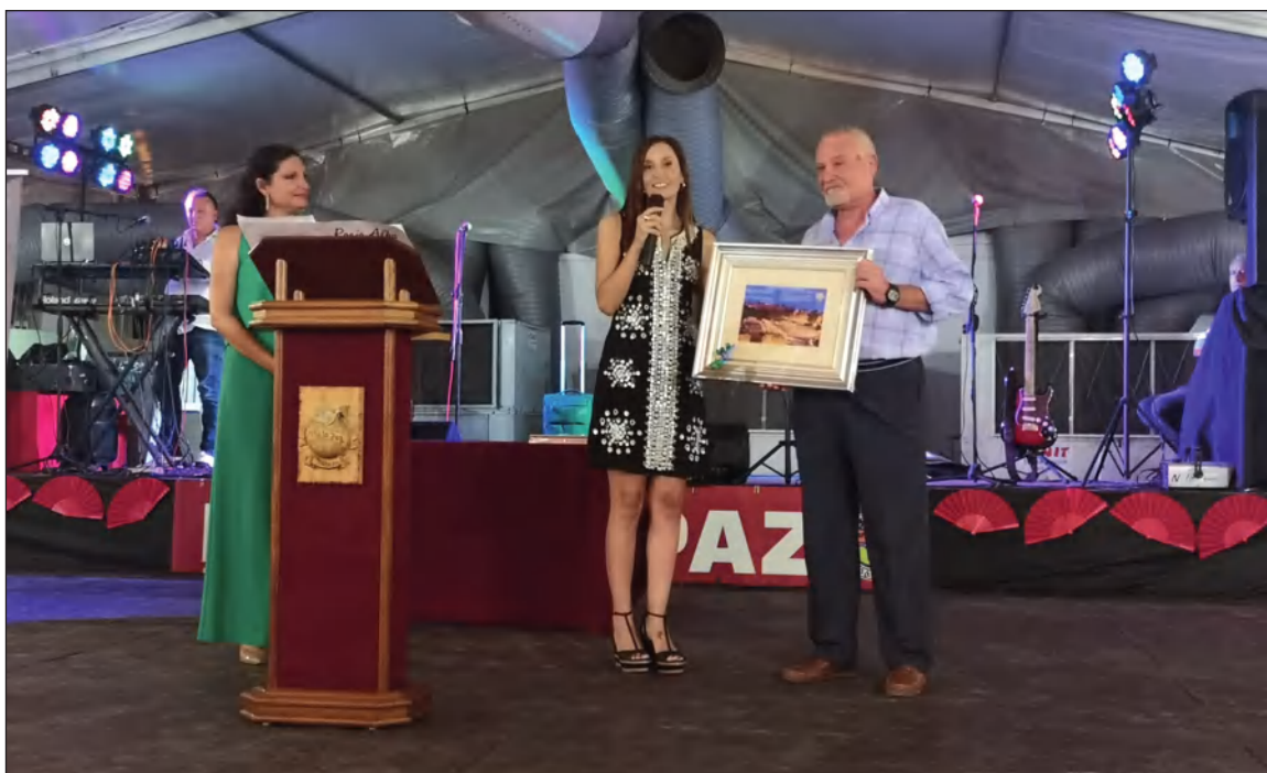
Recibimiento del Premio Andaluces de Primera de la Peña La Paz.

tiembre, la entidad organiza su tradicional Excursión a la Feria de Melilla del día 5 al 8; mientras que el día 17 habrá un almuerzo para celebrar el Día de Melilla, y el 24 se servirá el primer potaje de la nueva temporada.