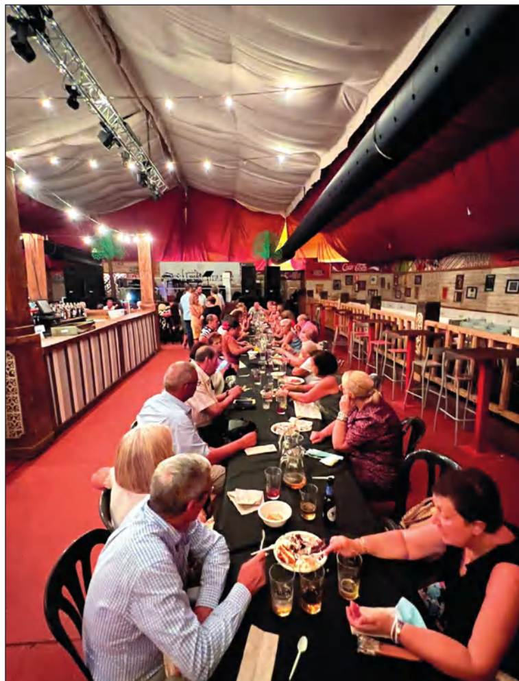
Cena de socios el viernes 12 de agosto.