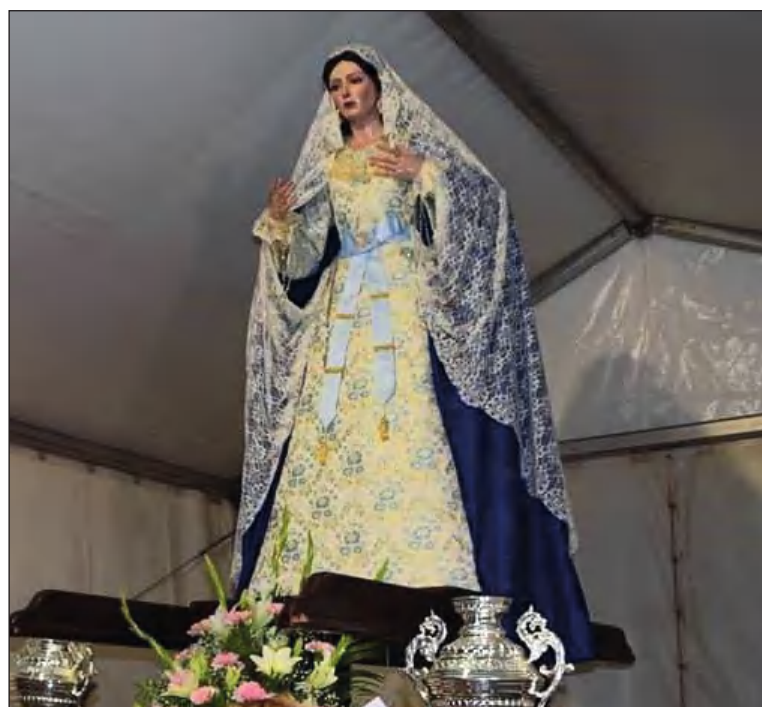
La Virgen de la Esperanza de Alhaurín de la Torre, en su trono procesional.