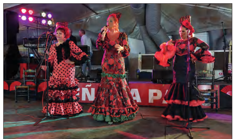
La música popular ha estado representada en distintas actividades.