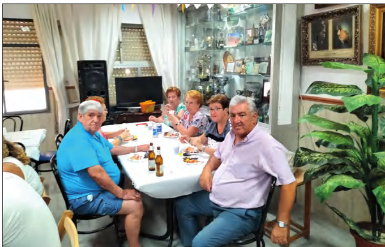
Comida de hermandad en la sede de la Peña San Vicente.