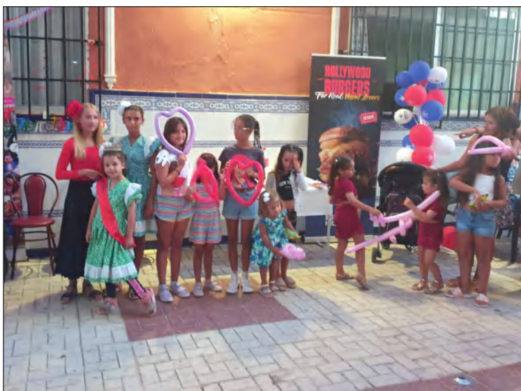
Algunos de los niños asistentes a la fiesta.

res para disfrutar de esta actividad en la que incluso se elegía a la Reina y el Míster infantil de esta entidad perteneciente a la Federación Malagueña de Peñas, Centros Culturales y Casas Regionales 'La Alcazaba'