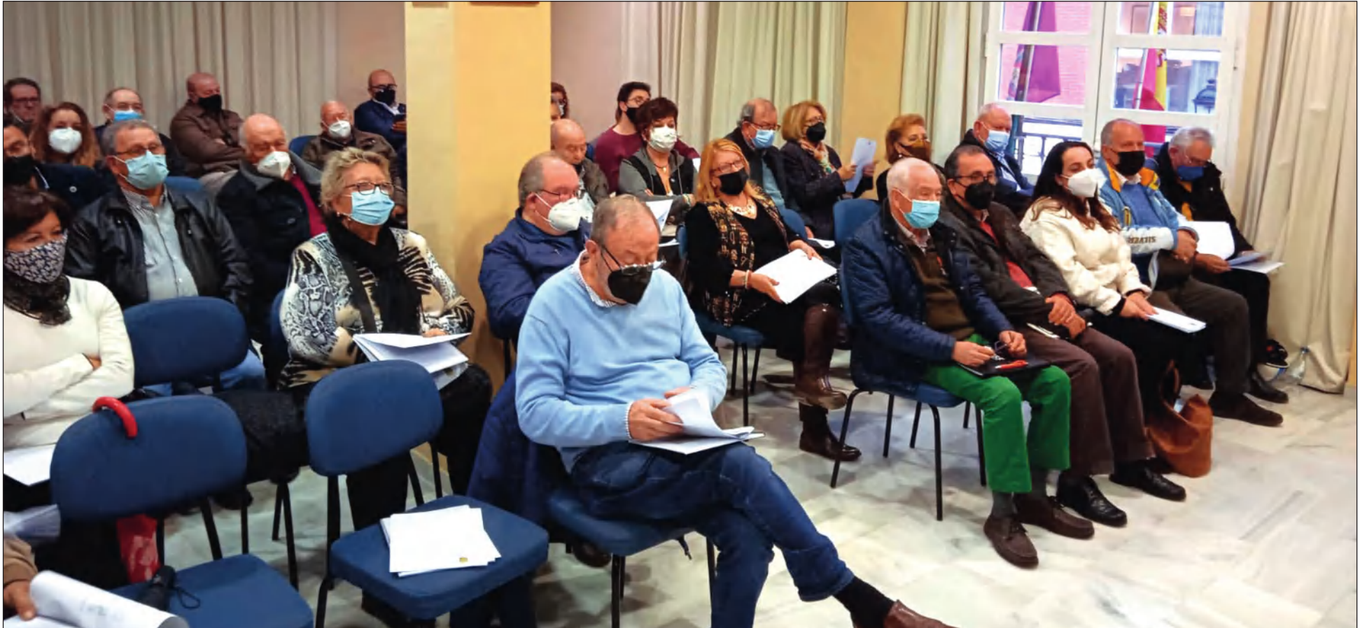
Asamblea General celebrada en la sede de la Federación Malagueña de Peñas en una convocatoria anterior.

• FEDERACIÓN MALAGUEÑA DE PEÑAS, CENTROS CULTURALES Y CASAS REGIONALES 'LA ALCAZABA'