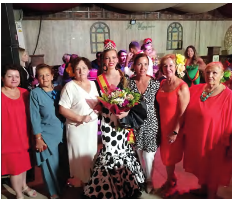
Con la Reina de la Peña El Sombrero.