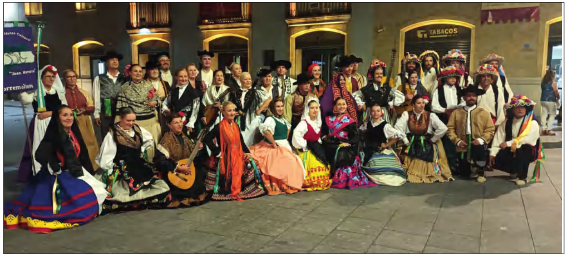
Integrantes del Grupo Folclórico en Salamanca.

en El Morche; mientras que la pasada semana se desplazaban primero al I Festival Internacional de Folclore Salamanca capital, y posteriormente al XLIII Festival de Folclore "Mancha Verde" en Argamasilla de Alba (Ciudad Real); para dar muestra de los cantes y bailes de nuestra tierra.