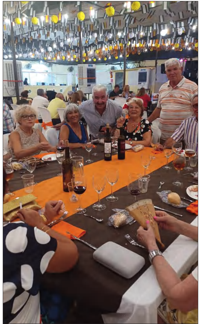
Socios disfrutaban de la actividad.