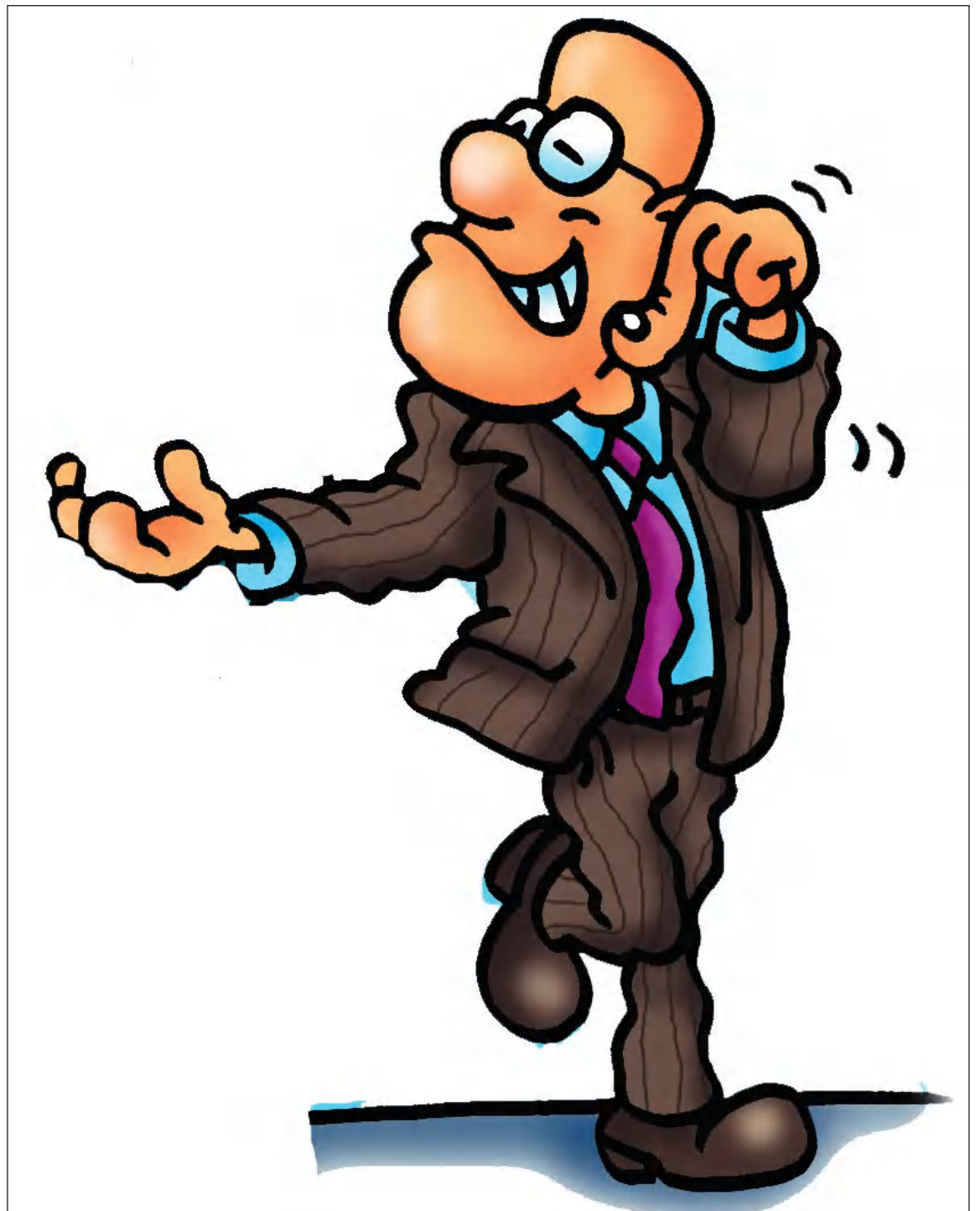
Ilustración de Enrique García

Con aquella ocurrencia del incómodo invitado, la reunión se acabó, no sin producirse los múltiples comentarios que sobre el respecto se hicieron luego.