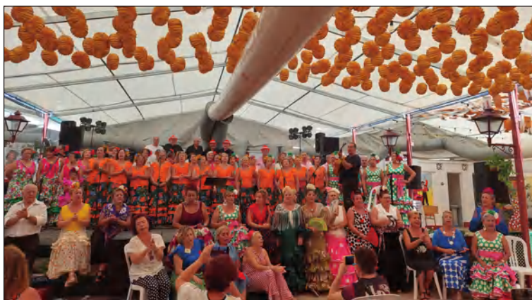
Encuentro de Coros.

Compartimos una selección de imágenes de estas actividades promovidas por la Peña La Paz en su caseta.