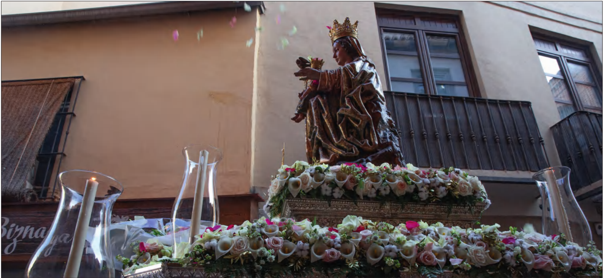
La Virgen era trasladada a la Catedral en la mañana del pasado domingo 28 de agosto.

El domingo 28 de agosto, la Virgen de la Victoria era trasladada como cada año hasta la Santa Iglesia Catedral, donde del 30 de agosto al 7 de septiembre se celebra su Solemne Novena.