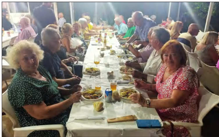
Socios disfrutando de la cena de hermandad.