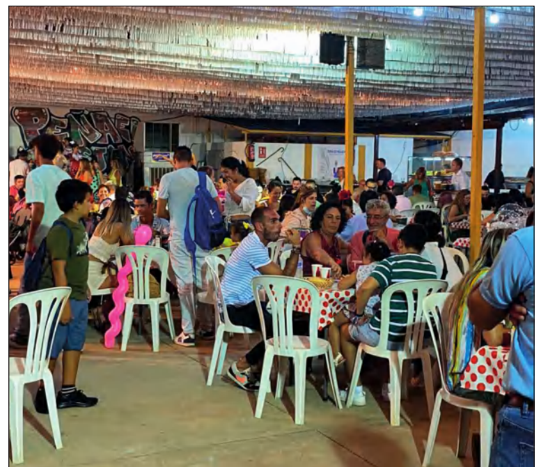
Ambiente en la caseta de la Peña El Bastón.