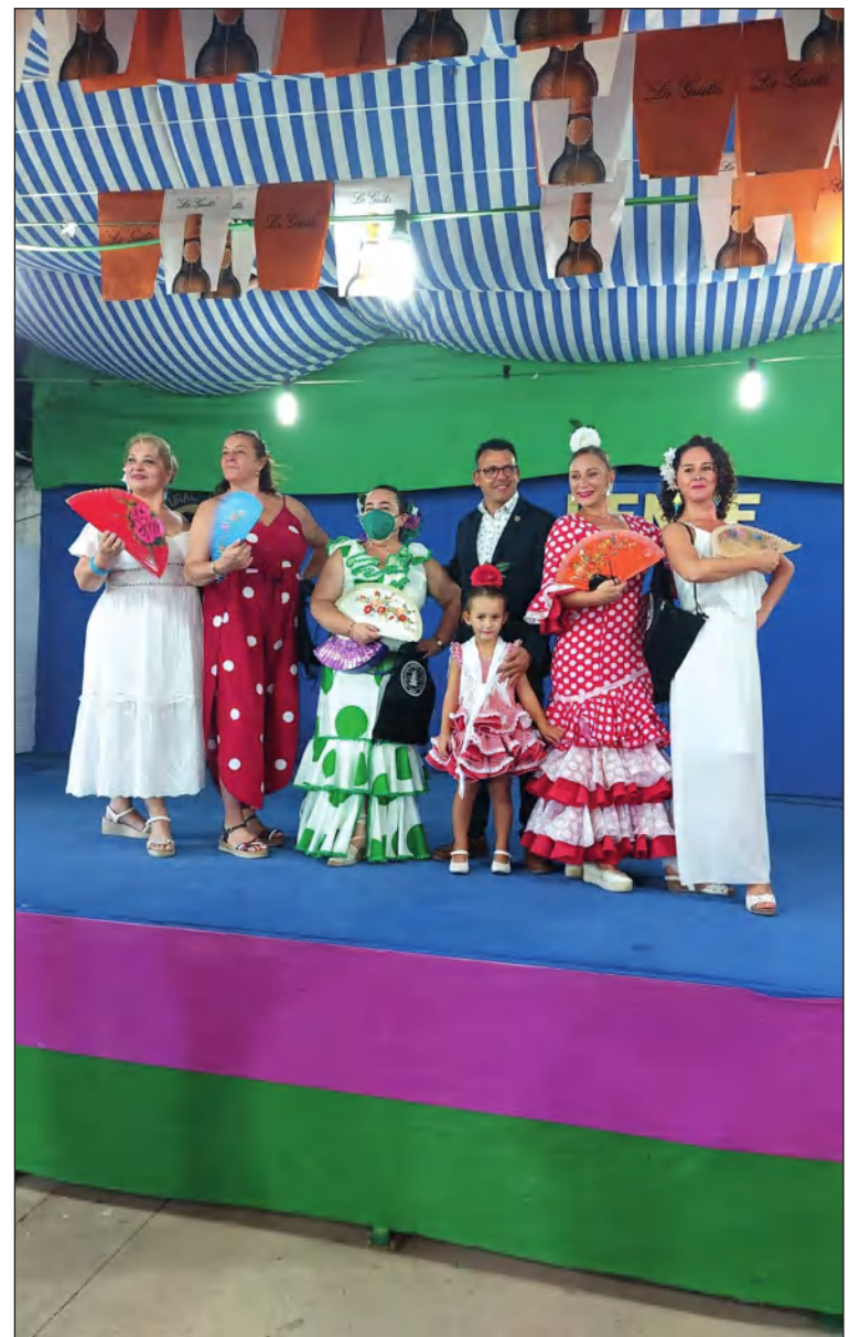
Encuentro de Castañuelas en la caseta.