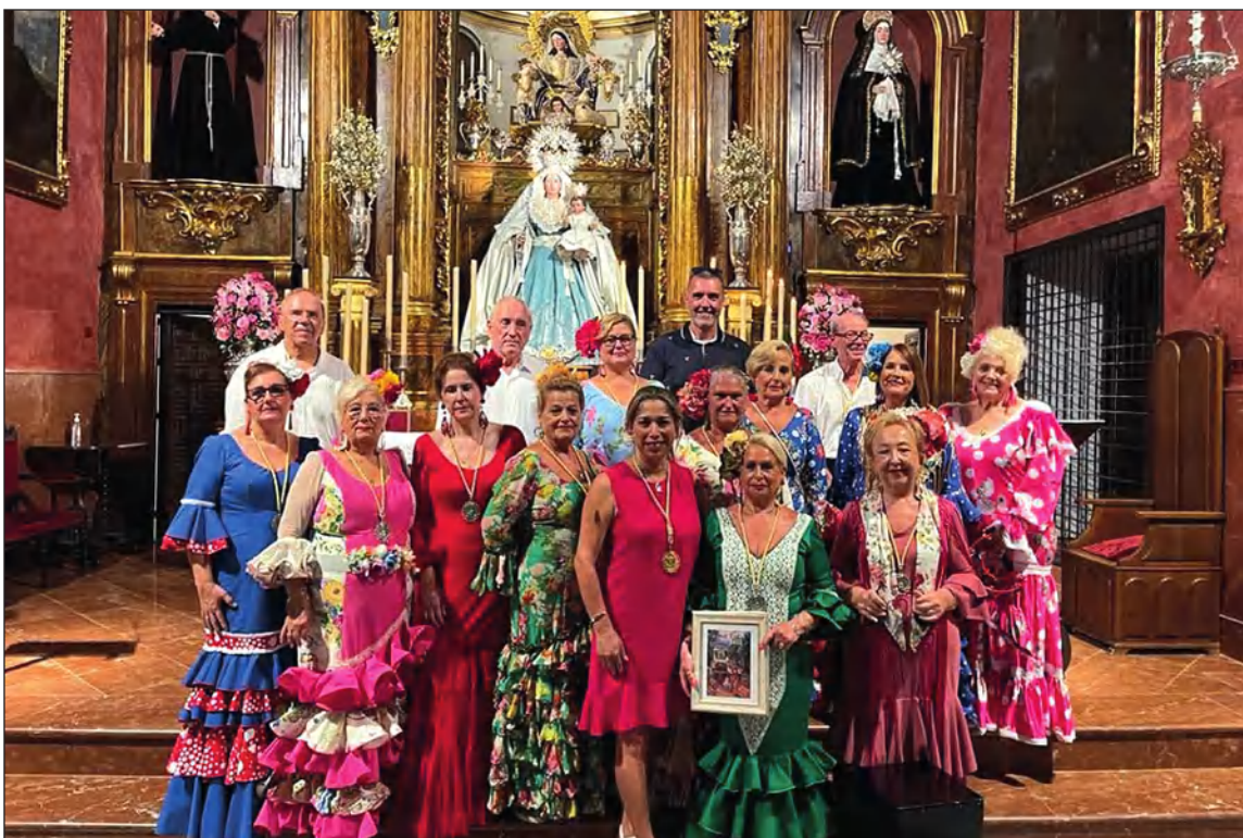
Componentes del coro ante la Virgen de la Alegría.

coro de esta entidad perteneciente a la Federación Malagueña de Peñas, Centros Culturales y Casas Regionales 'La Alcazaba' tenía otra cita especialmente emotiva, al cantar en la jornada del 25 de agosto en el Triduo de la Hermandad de la Alegría, por lo que recibieron un detalle por su participación.