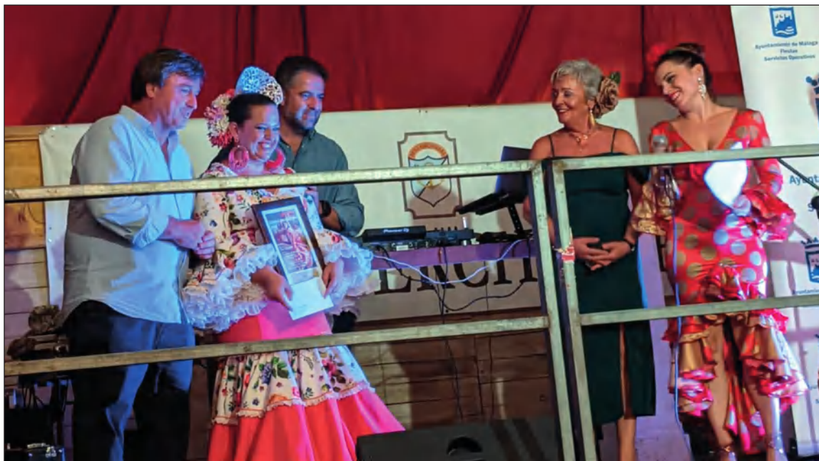
Entrega de premios del Certamen de Copla del Barrio del Perchel.