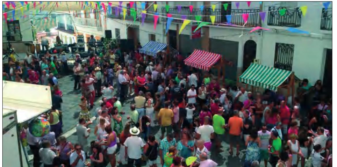
Imagen de una edición anterior de la Feria de la Aceituna de Alozaina