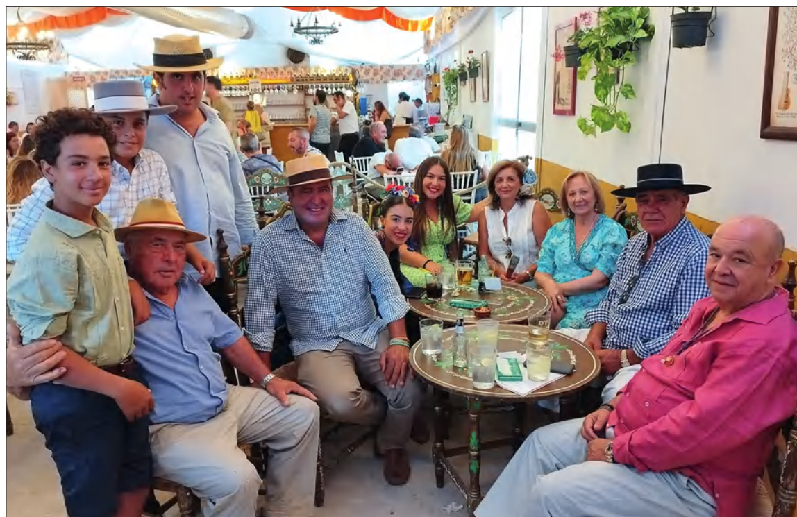
Artistas en el escenario de la caseta de la Federación Malagueña de Peñas.

es la Feria de Málaga desde la caseta de Cortijo de Torres de esta entidad integrada en la Federación Malagueña de Peñas, Centros Culturales y Casas Regionales 'La Alcazaba'.