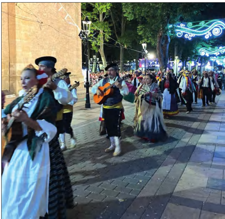
Pasacalles en el Festival de Argamasilla de Alba.