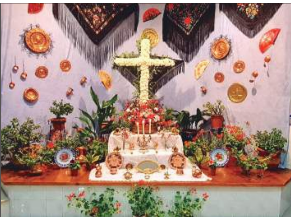
Peña La Asunción.