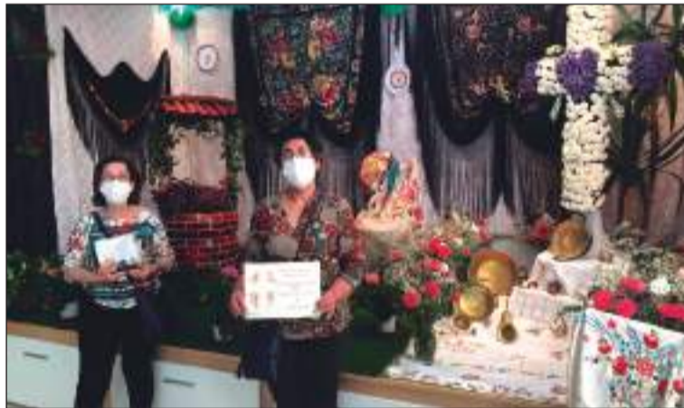
Socias de la Peña Nueva Málaga muestran el premio ante su Cruz de Mayo.