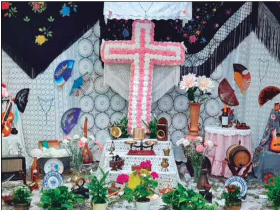
Peña Simpatía La Luz.