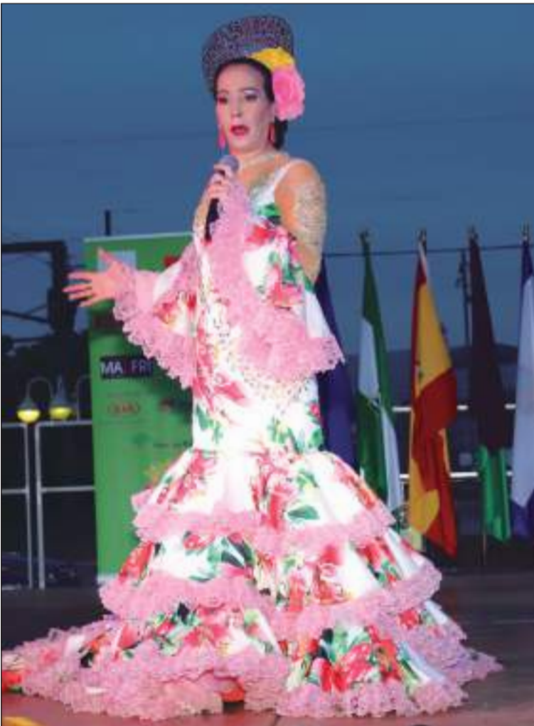
La velada estuvo cargada de arte en Cortijo de Torres.