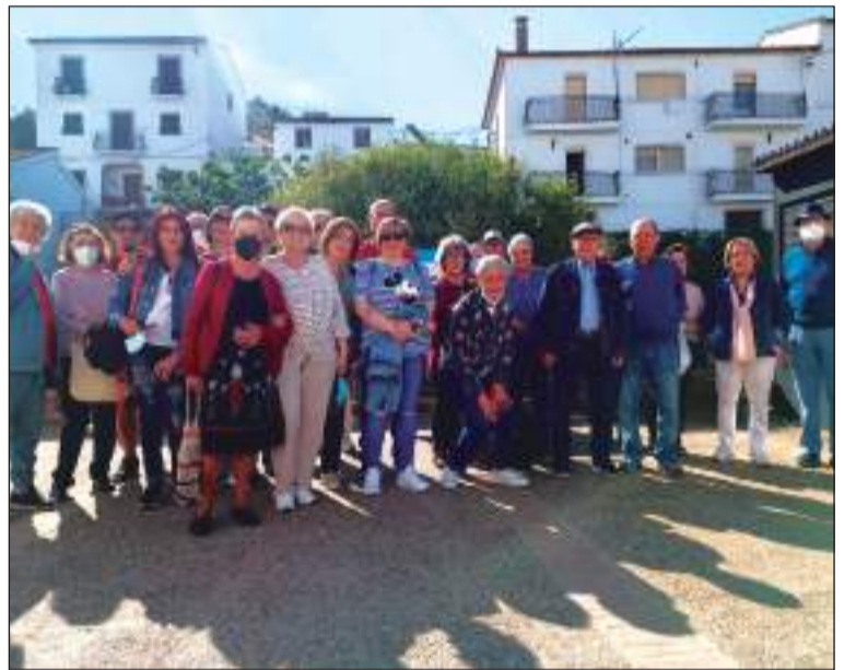
Socios de la Peña Nueva Málaga durante la excursión.

tes de esta entidad perteneciente a la Federación Malagueña de Peñas, Centros Culturales y Casas Regionales 'La Alcazaba' pudieron recorrer algunos de los rincones más pintorescos de ambas localidades.