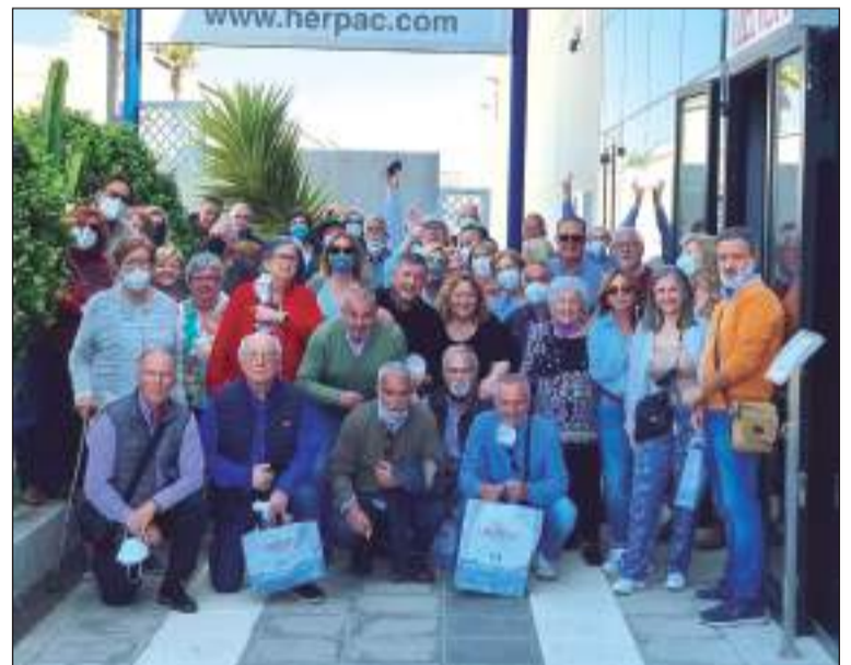
Grupo de socios de la Agrupación Cultural Telefónica.

Un nutrido grupo de socios de la Agrupación Cultural Telefónica, visitaba el 30 de abril la localidad gaditana de Barbate, donde se pudo presenciar el inmemorial rito del "Ronqueo del Atún", todo ello aderezado con un espléndido día, un abundante desayuno en ruta, un típico almuerzo atunero a escasos metros del mar y una visita a Tarifa.