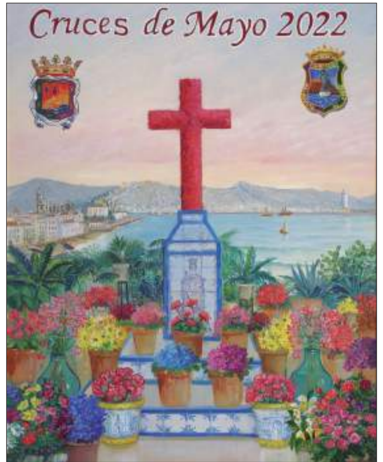
Cartel de las Cruces 2022, obra de José Luis Pavón Paradas.

La decisión del Jurado será inapelable; reservándose la organización el derecho de modificar cualquier punto, en interés de dicho Certamen de Cruces de Mayo.