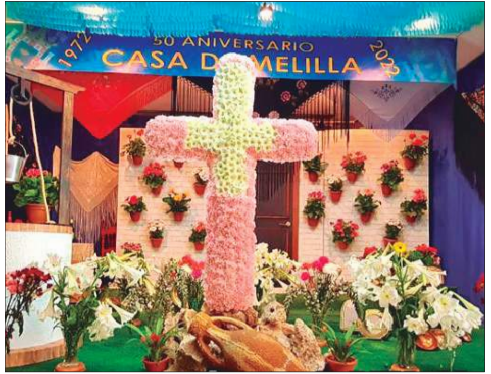
Casa de Melilla en Málaga.