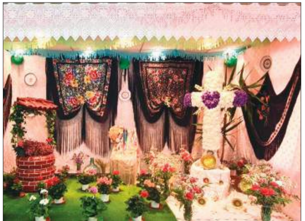
Peña Nueva Málaga