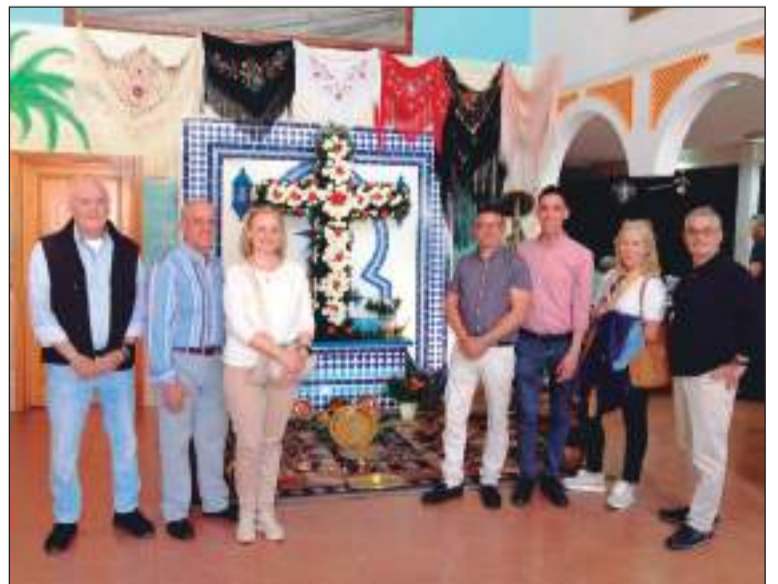
Miembros del jurado y representantes socialistas en la sede de la entidad.