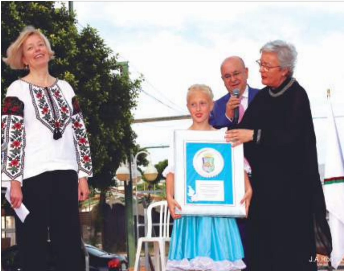
Entrega de un recuerdo al Consulado de Ucrania en Málaga.

• FEDERACIÓN MALAGUEÑA DE PEÑAS, CENTROS CULTURALES Y CASAS REGIONALES 'LA ALCAZABA'