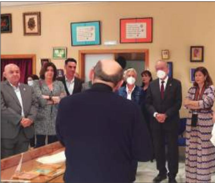
El párroco se dirige a los asistentes al acto.