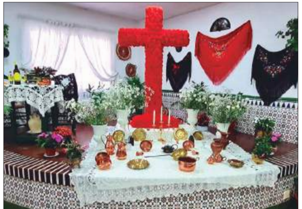
Peña Jardín de Málaga.