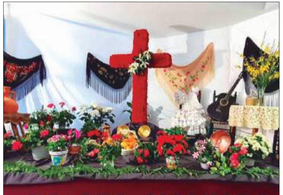
Asociación de Vecinos Hanuca.