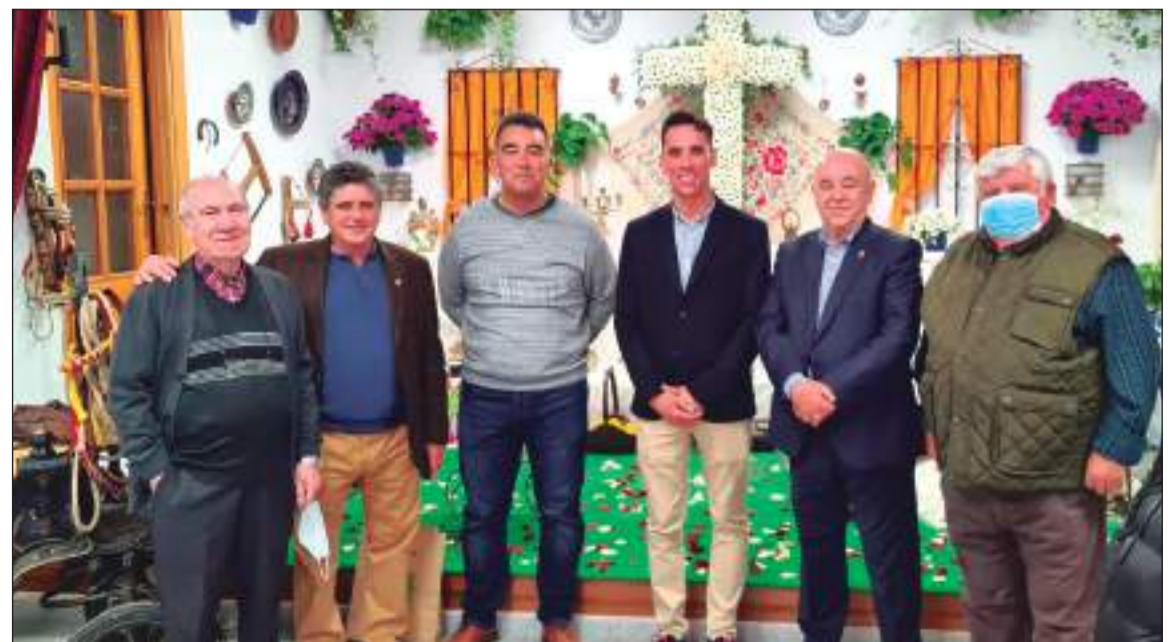
Imagen del acto de inauguración de la Cruz.

Junta Directiva de la Federación Malagueña de Peñas, Centros Culturales y Casas Regionales 'La Alcazaba'.