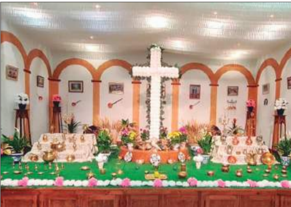
Casa de Álorá Gibralfaro.