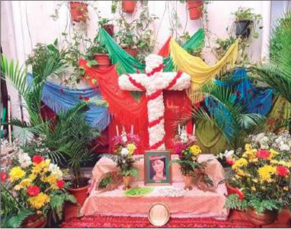
Peña Los Rosales.