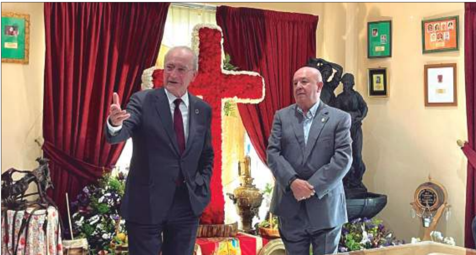
La Federación Malagueña de Peñas, por segundo año consecutivo, ha instalado su Cruz de Mayo en su sede social; inaugurada por el alcalde.

Web: www.femape.com Edición digital: www.femape.com/laalcazabadigital Twitter: @FMPLaAlcazaba Facebook: FMPLaAlcazaba