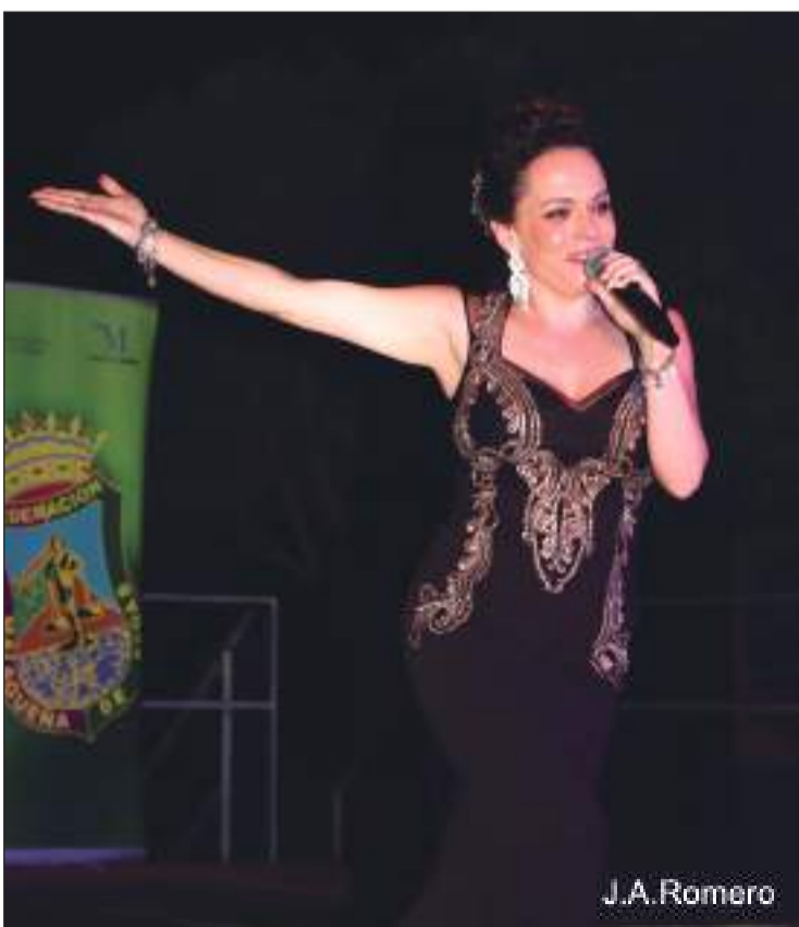
Homenaje Nacional a la Copla.