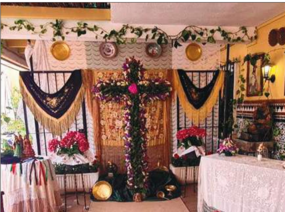
Peña El Sombrero.