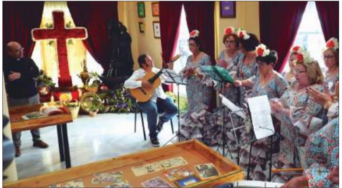
Intervención del Coro de la Peña Tiro Pichón, en presencia del sacerdote.

La Cruz de la Federación tiene un importante valor simbólico en cuanto a la evolución de la fiesta en Málaga se refiere. De este modo, según el plan establecido, será el próximo año cuando se instale en un espacio público emblemático de la ciudad, y alrededor de la cual se desarrollarán diferentes muestras del folclore popular. Desde la Federación ya se trabaja con el Ayuntamiento en hacer posible esta gran Fiesta de la Cruz.