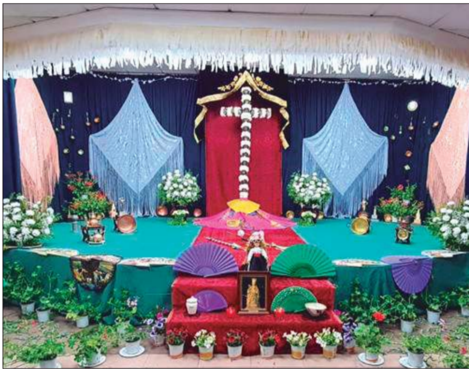
Peña La Paz.