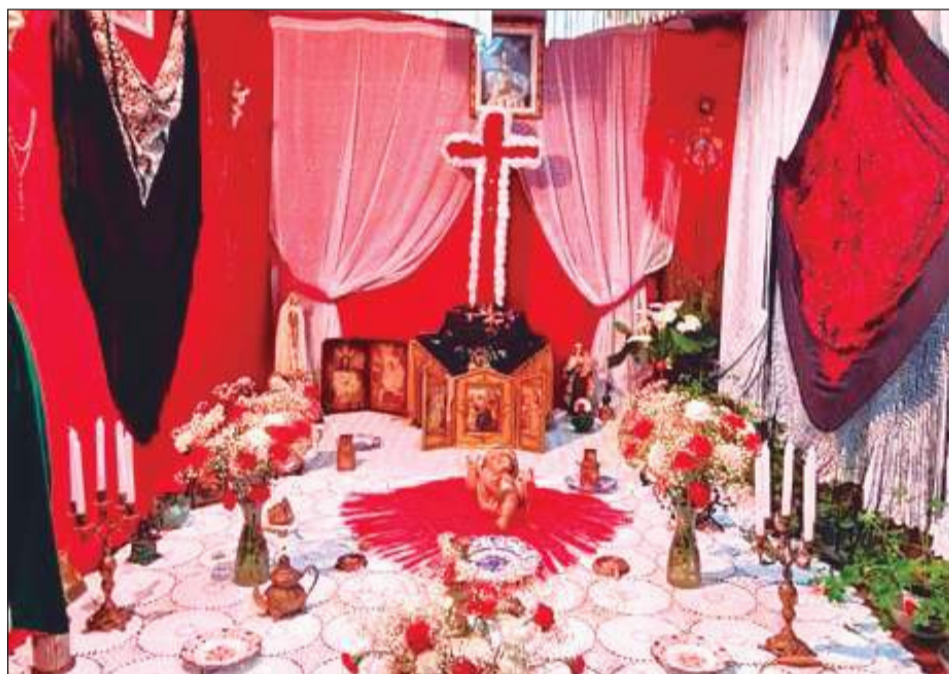
Peña Santa Marta.