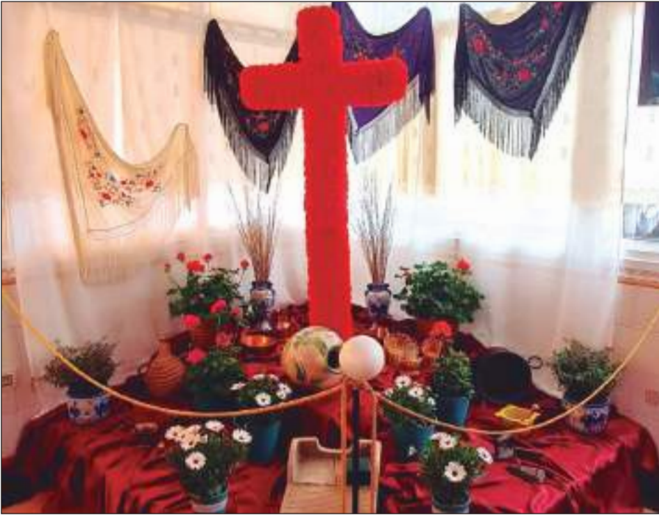
Peña Colonia Santa Inés.