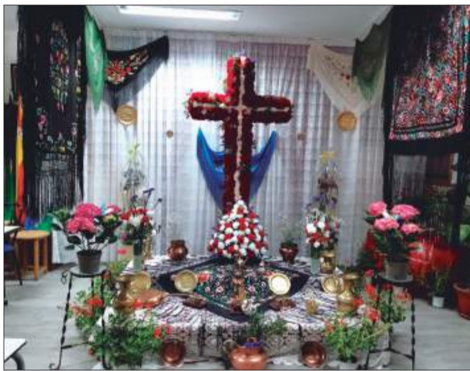
Peña San Vicente de Paúl.