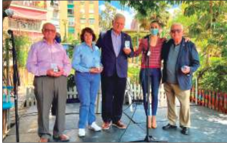
Reconocimiento a los componentes del jurado.