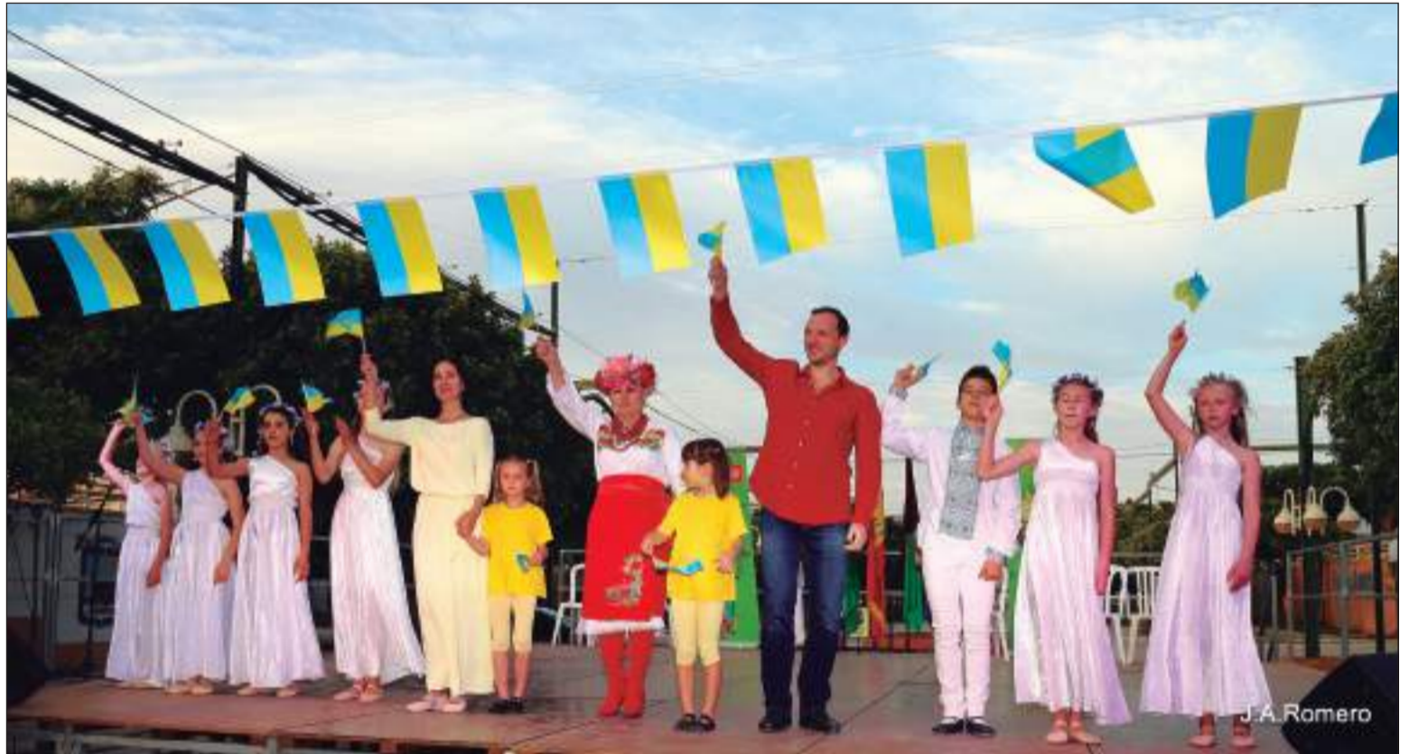
El folclore ucraniano estuvo representado en esta edición de FIFMA 2022.

Para esta actuación especial, contaron con el acompañamiento