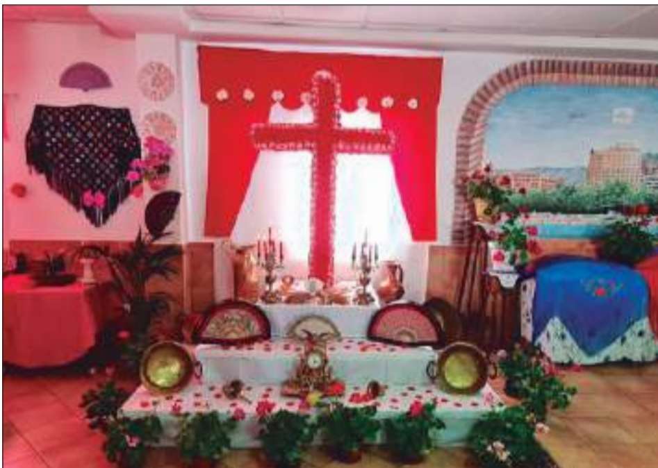
Peña Montesol Las Barrancas.