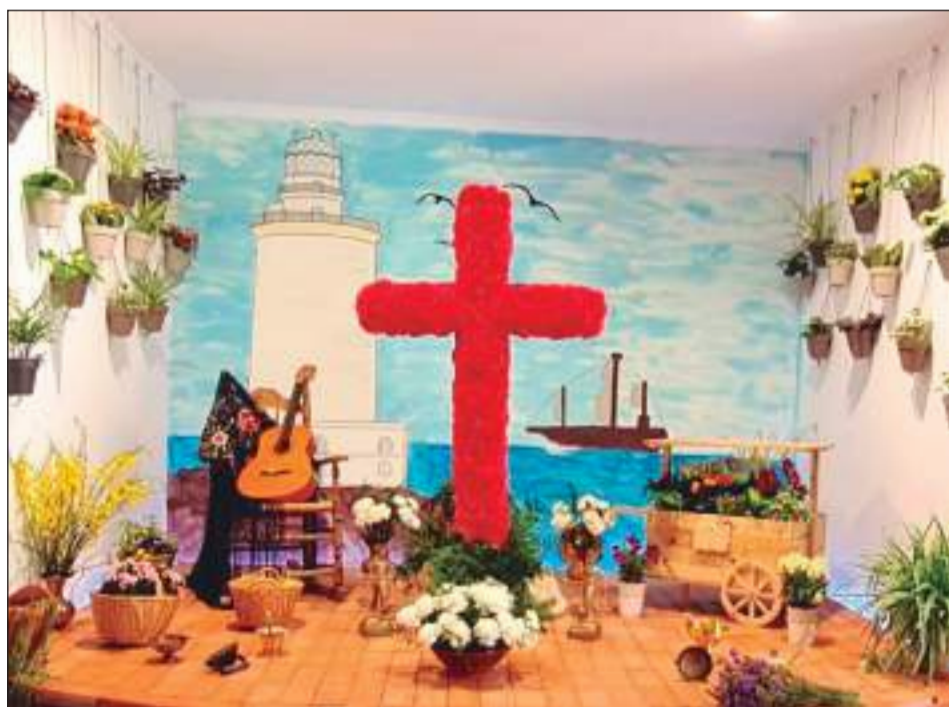
Peña Finca La Palma.