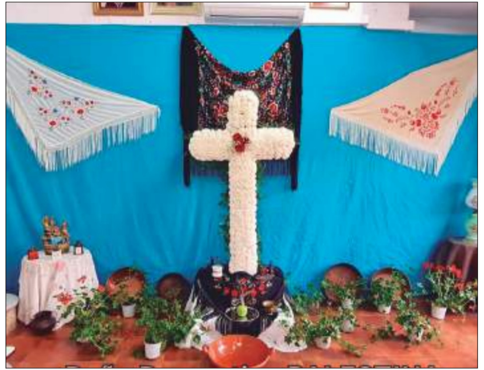
Peña Recreativa Palestina.