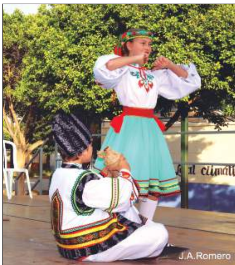
Festival Internacional de Folclore de Málaga (FIFMA 2022).