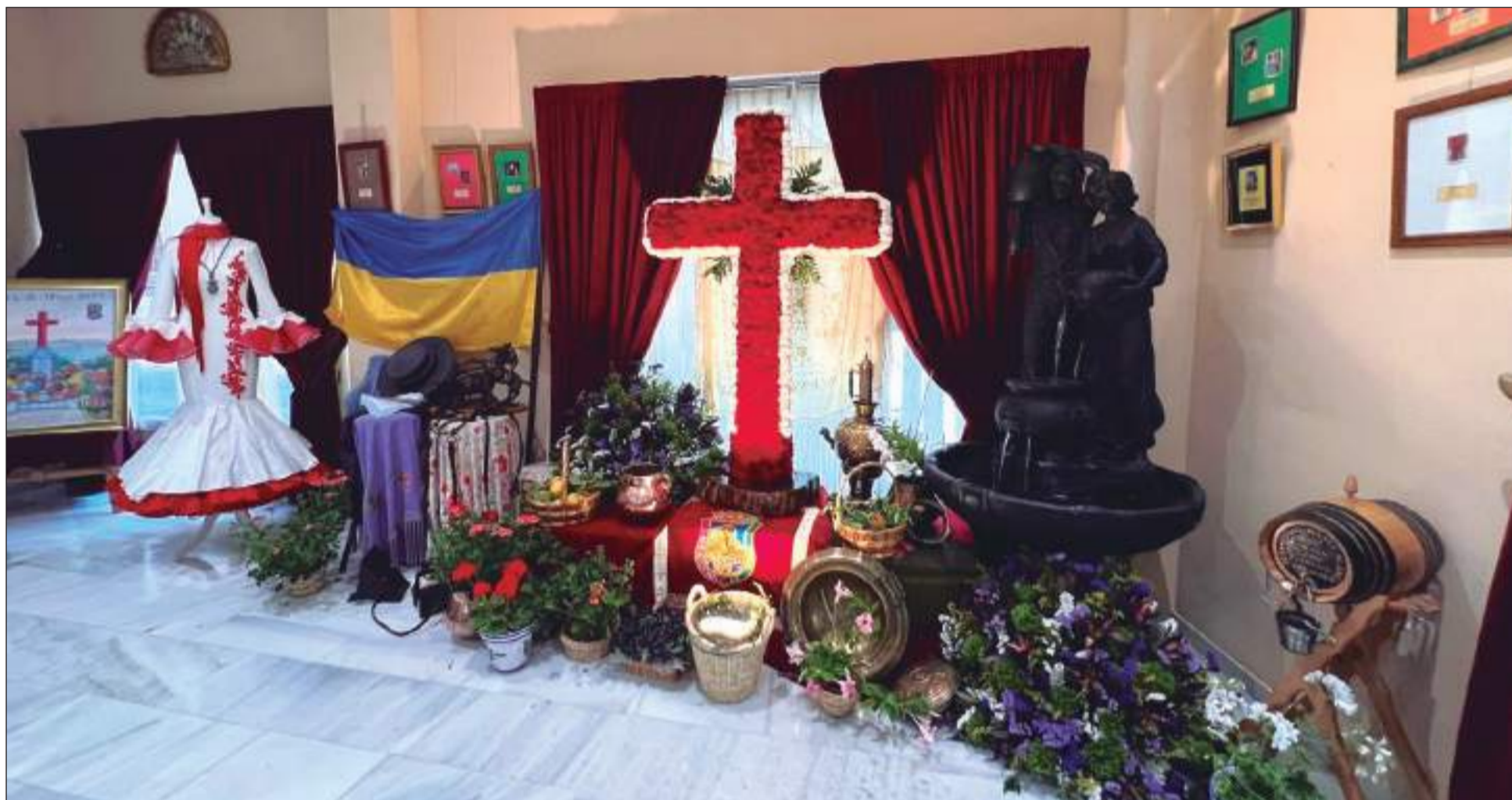
Cruz de Mayo de la Federación Malagueña de Peñas, instalada en la Sala de Usos Múltiples FEMAPE - Alcazaba.

• FEDERACIÓN MALAGUEÑA DE PEÑAS, CENTROS CULTURALES Y CASAS REGIONALES 'LA ALCAZABA'