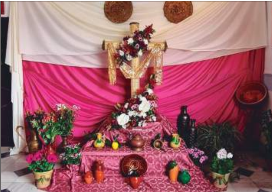
Asociación de Vecinos Colonia Santa Inés.