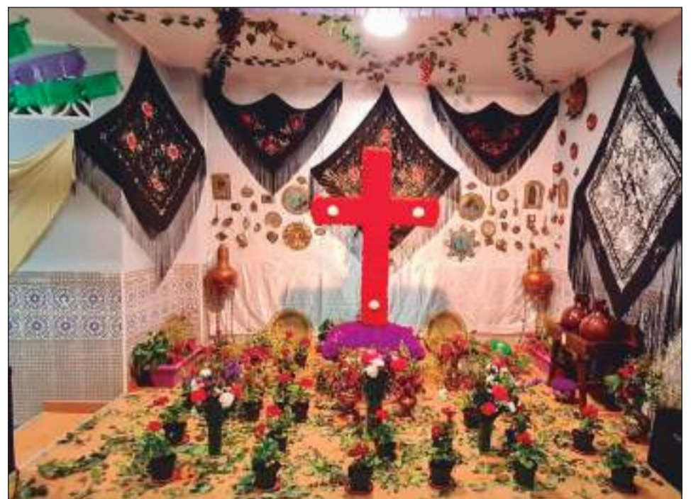
Peña El Parral.