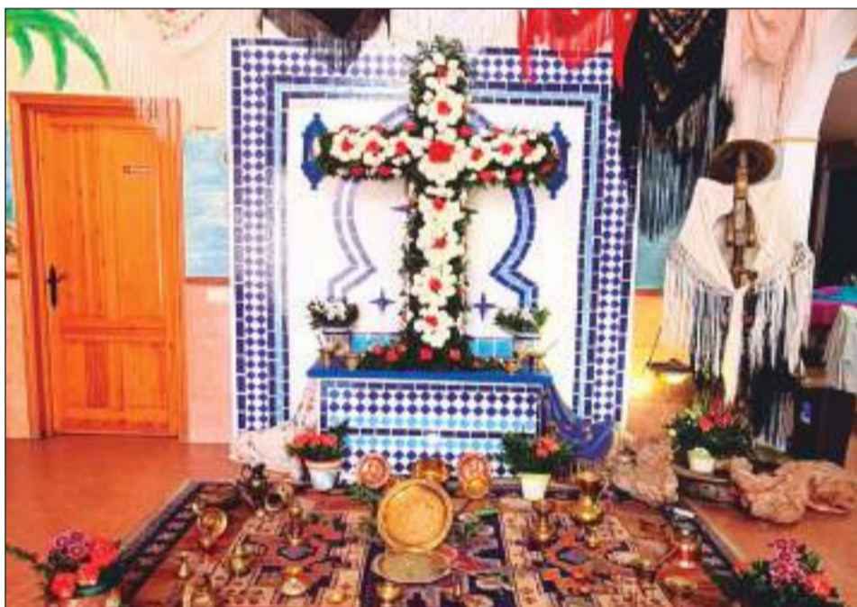
Centro Cultural Renfe.