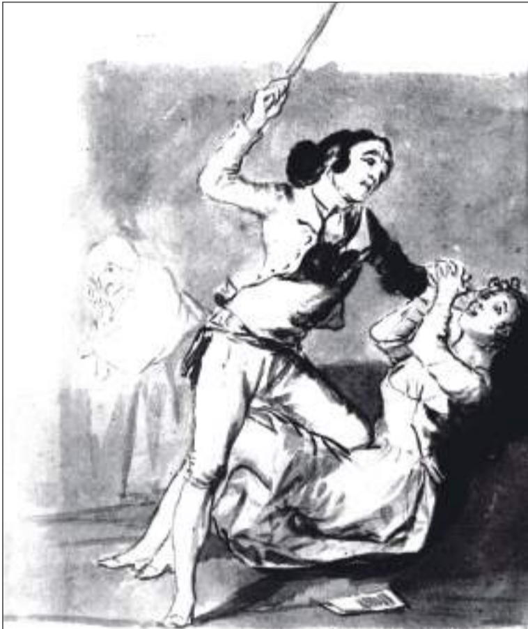
Ilustración de un rabado de Goya.