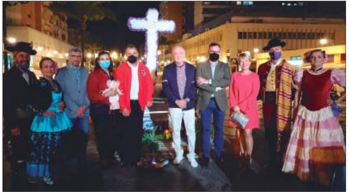
Inauguración de la Cruz de Mayo.