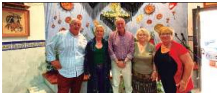
El presidente José Arriaza, con invitados y componentes de la entidad.

La Peña La Asunción celebra el Día de la Madre junto a su