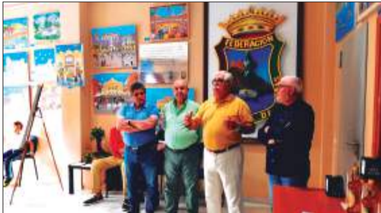
Representación peñista con el hermano mayor y miembros de la congregación.

La muestra, organizada por la Comisión de Cultura de la Federación Malagueña de Peñas, se puede visitar de lunes a viernes de 10 a 13 y de 17 a 20 horas en calle Victoria, 17.