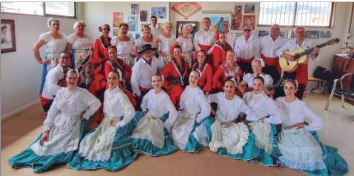
Integrantes del grupo folclórico.

Desde este grupo, perteneciente a una entidad integrada en la Federación Malagueña de Peñas, trabajan en próximos compromisos en Alhaurín de la Torre.