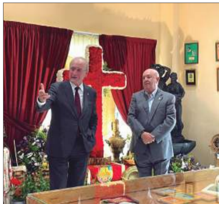
El alcalde de Málaga, durante su intervención.