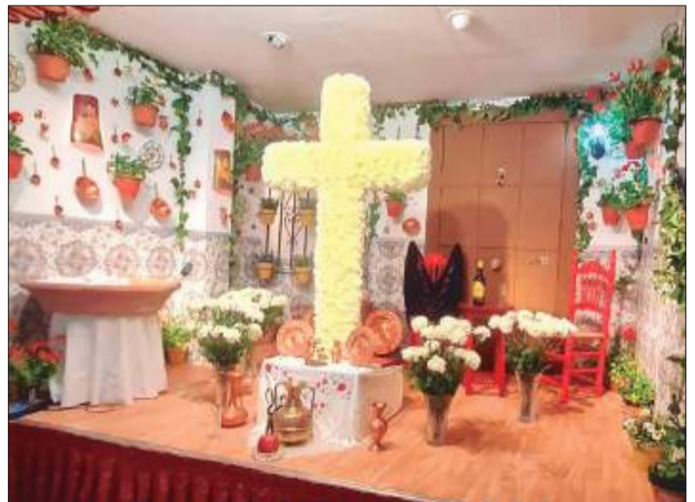
Peña Costa del Sol.