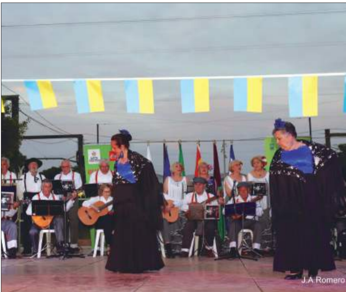
Rondalla San Roque de Huétor Vega.

También estaba anunciada la participación del Grupo de Folclore Argentino Martín Fierro, que finalmente no pudo participar por un fallo en la coordinación de los horarios, por lo que desde la organización se les quiere transmitir su más sincera disculpa.