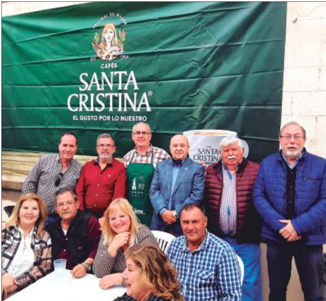
Cafés Santa Cristina colaboró con la Jornada de Convivencia organizada por la Asociación de Vecinos Hanuca.