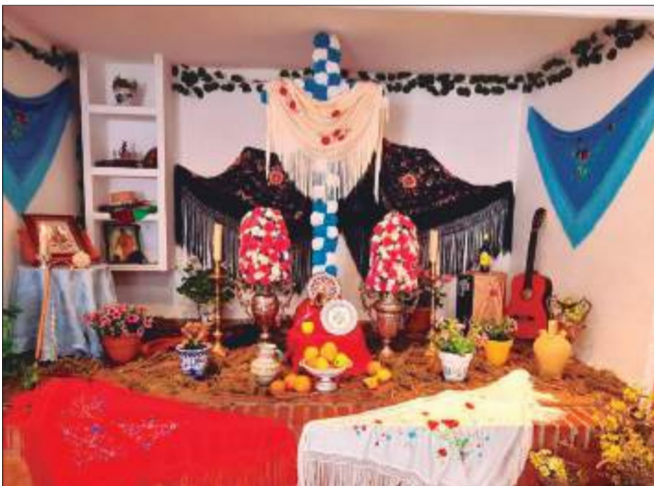
Peña Malaguista Super Basti.