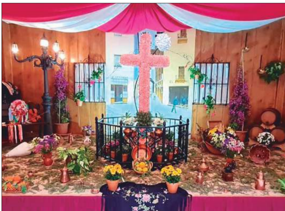
Peña Santa Cristina.