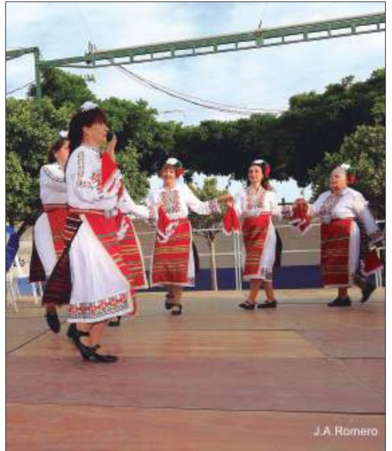
Asociación Rosa Búlgara.