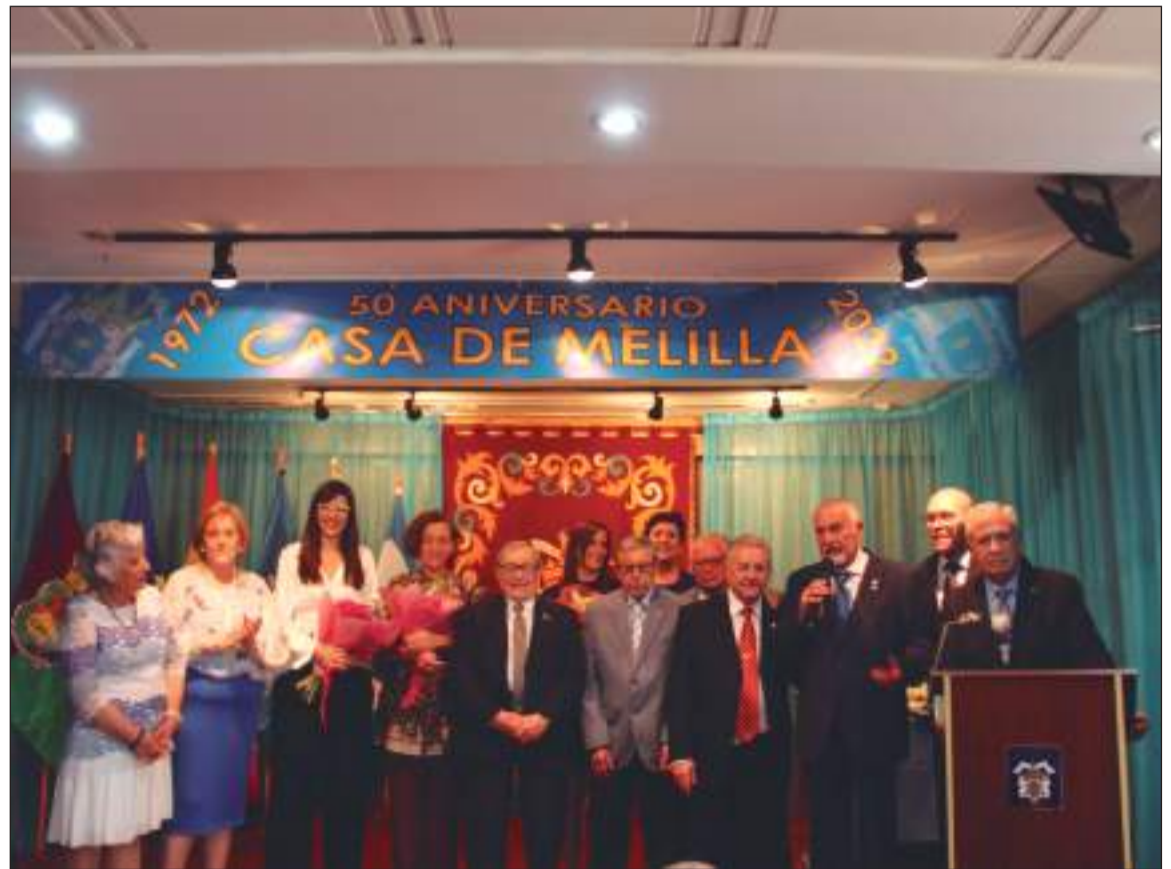
Autoridades y junta directiva de la Casa de Melilla en Málaga.