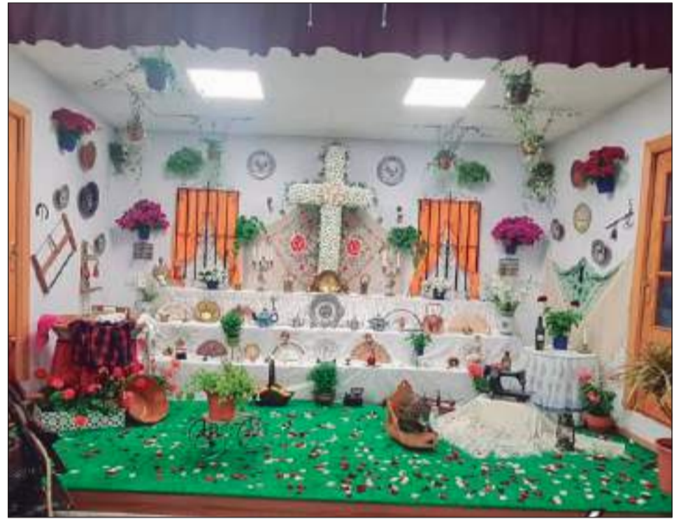
Peña Tiro Pichón.