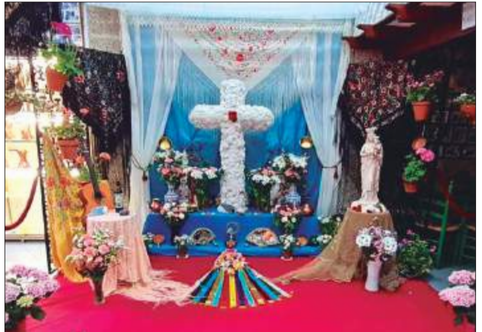
Peña El Palustre.