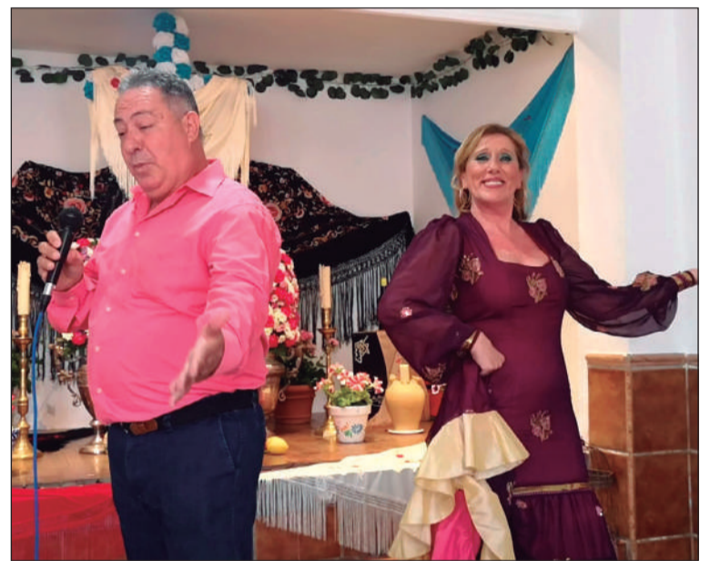
Un momento del espectáculo de Canción Española.

La primera actividad conjunta en la que participa es en el Certamen de Cruces de Mayo, que han festejado con canción española en su sede en una jornada muy especial para todos los componentes de esta nueva entidad federada.