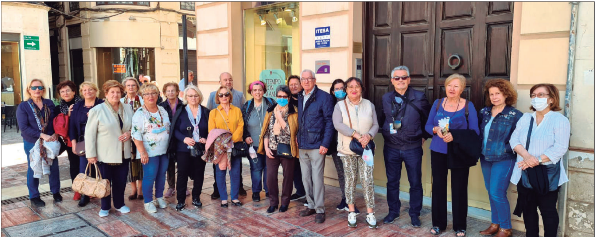
Algunos de los participantes en esta Visita Guiada a la Málaga Monumental.

Desde allí, se inició un recorrido por diferentes puntos de interés, aportando a los participantes numerosos datos desconocidos para ellos.