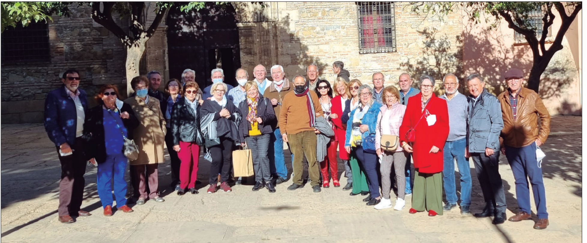
Grupo de socios de la Agrupación Cultural Telefónica de Málaga en el Patio de los Naranjos de la Catedral.