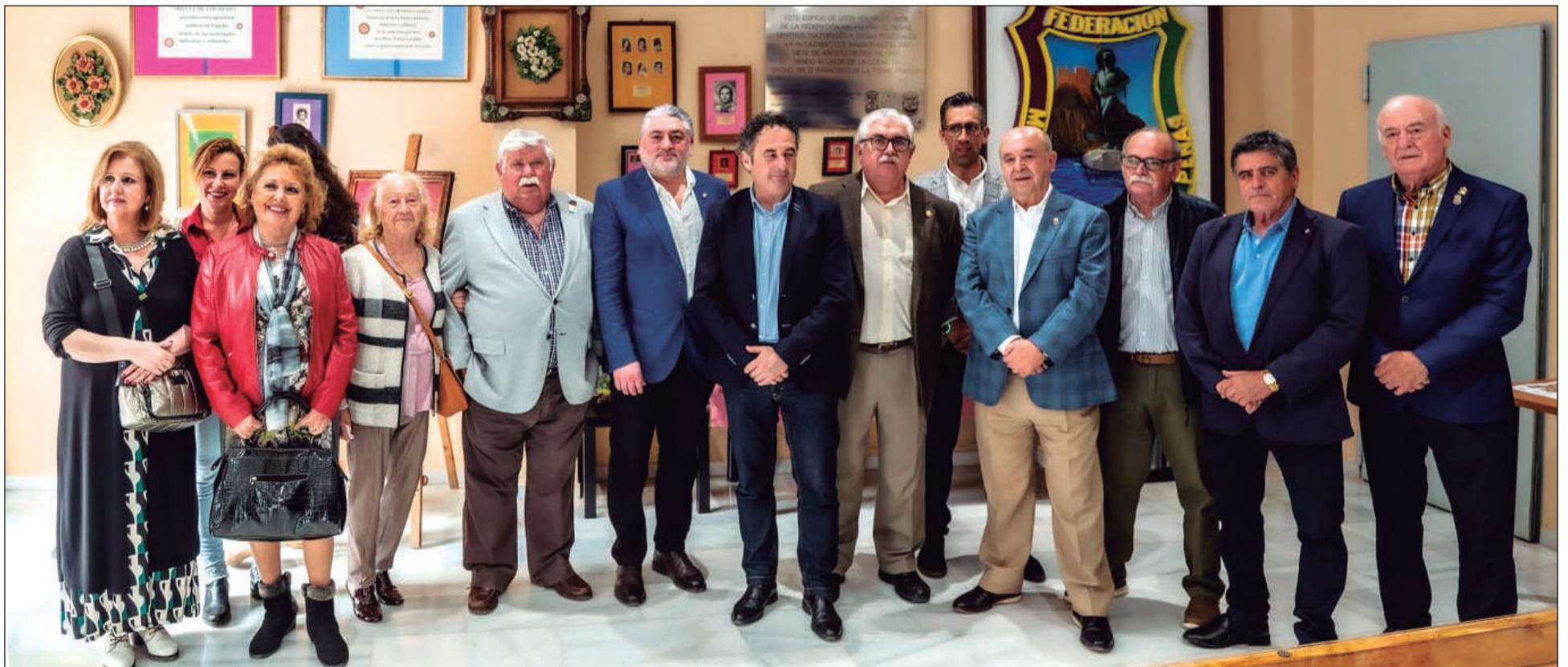
Asistentes al acto de inauguración de la Sala de Usos Múltiples FEMAPE - Alcazaba, en la que se presentaba la exposición 'La Copla en cromos y tebeos'.

Hay cosas que son exclusivamente malagueñas