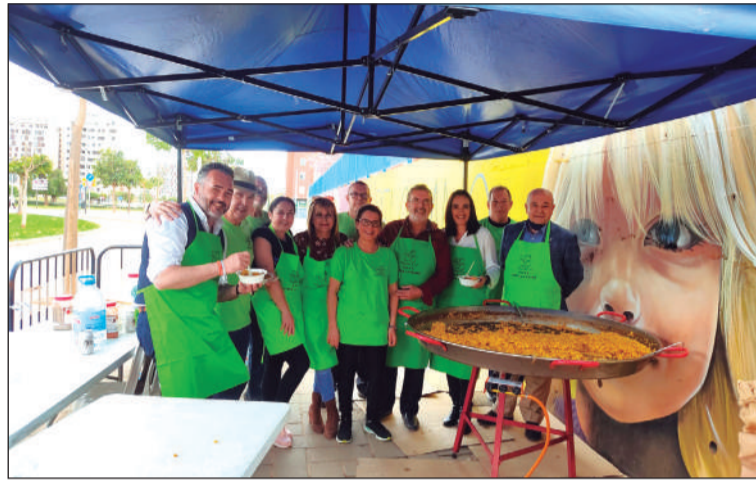
Preparativos de la paella, con la presencia del presidente de la Federación.

Así, se contaba con actuaciones, una gran paella gratis, una degustación de café, entre otras alternativas de ocio; contándose con un gran respaldo de socios y vecinos.