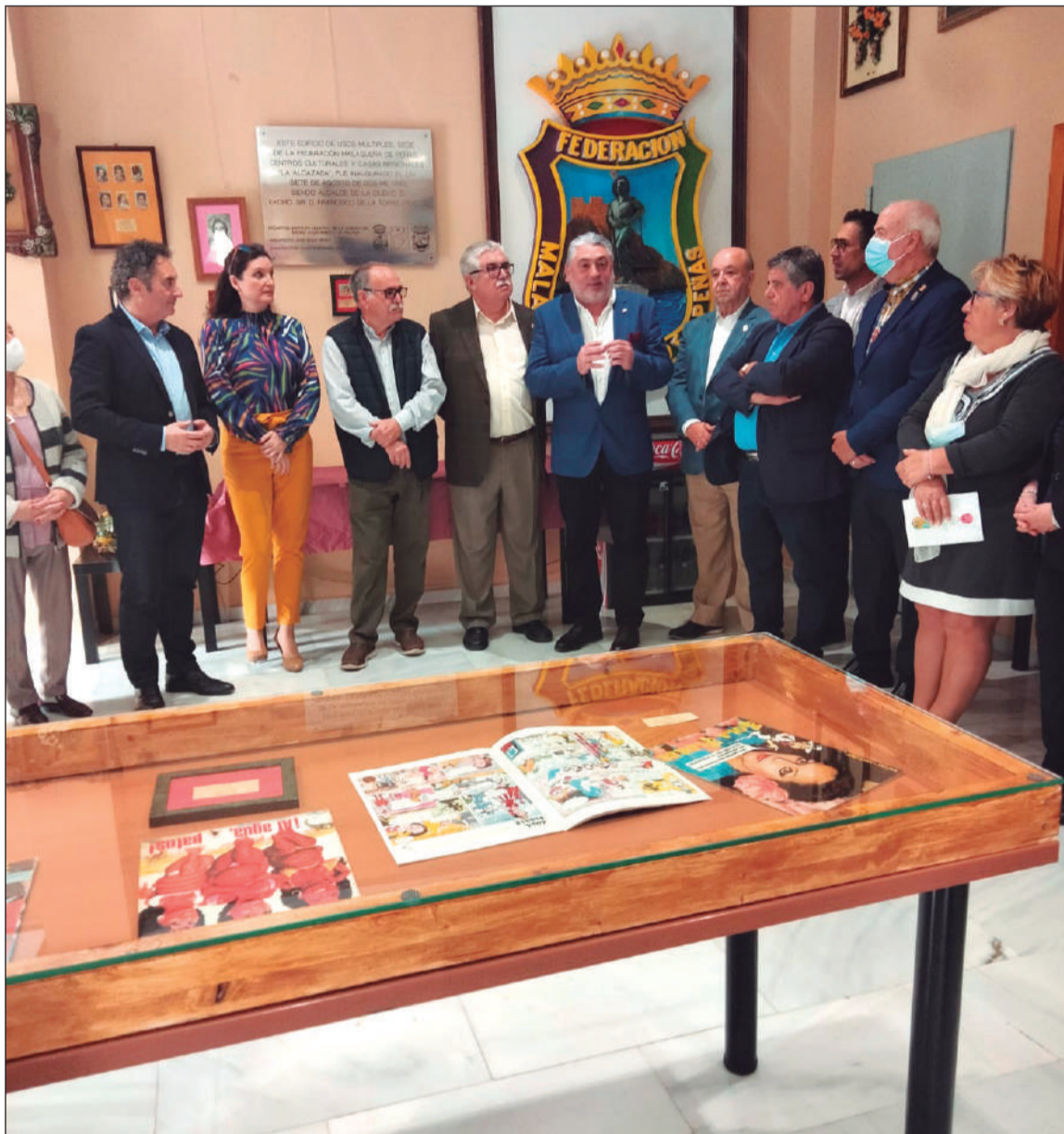
Presentación de la exposición en la Sala de Usos Múltiples FEMAPE - Alcazaba.