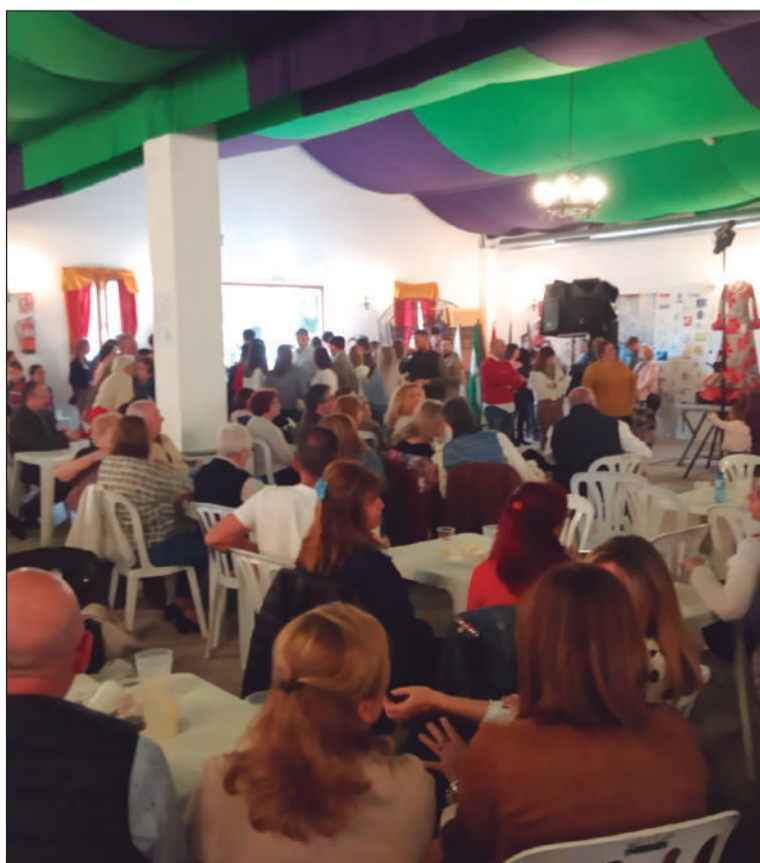
Vista general de la caseta de la Federación en la Pará Rociera.