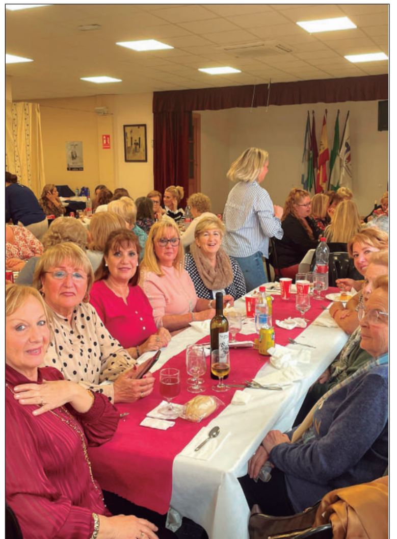
La presidenta de Los Mimbrales y esposa del presidente, en primer plano.

Unicaja Banco, S.A. Avda. Andalucía 19-22, 29007 Málaga, C.I.F. A01130033