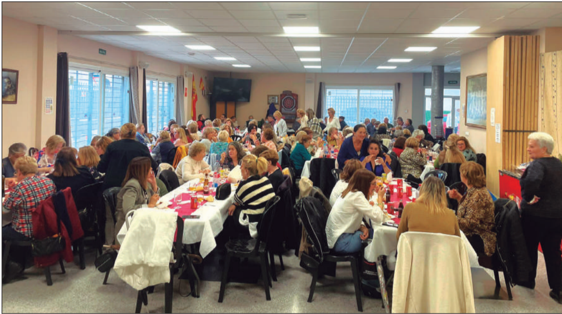
Vista general del salón de la Peña Tiro Pichón.

• FEDERACIÓN MALAGUEÑA DE PEÑAS, CENTROS CULTURALES Y CASAS REGIONALES 'LA ALCAZABA'