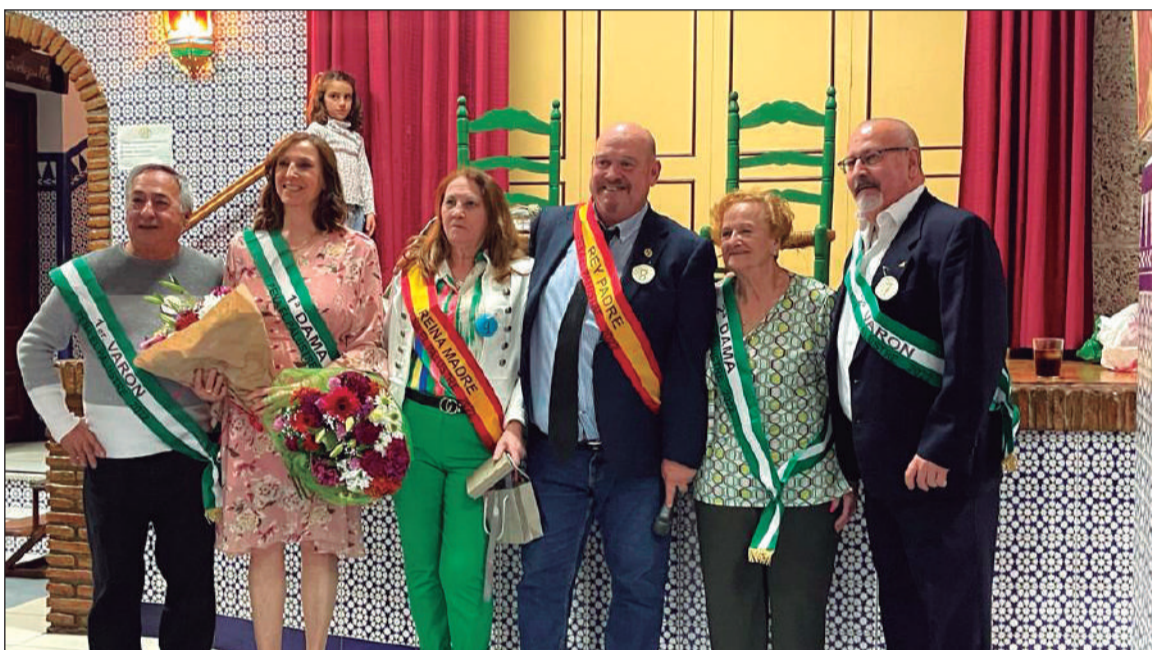
Los Reyes de la Peña El Palustre, con sus damas y varones elegidos el pasado 23 de abril.