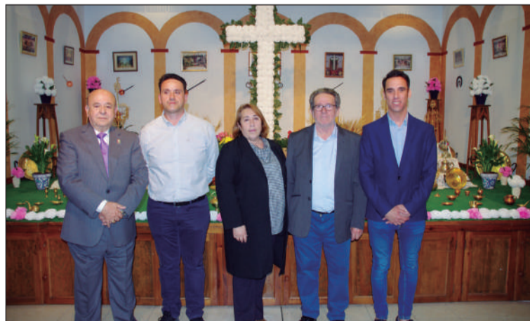
Curtido y Villa, con el párroco y los concejales socialistas.