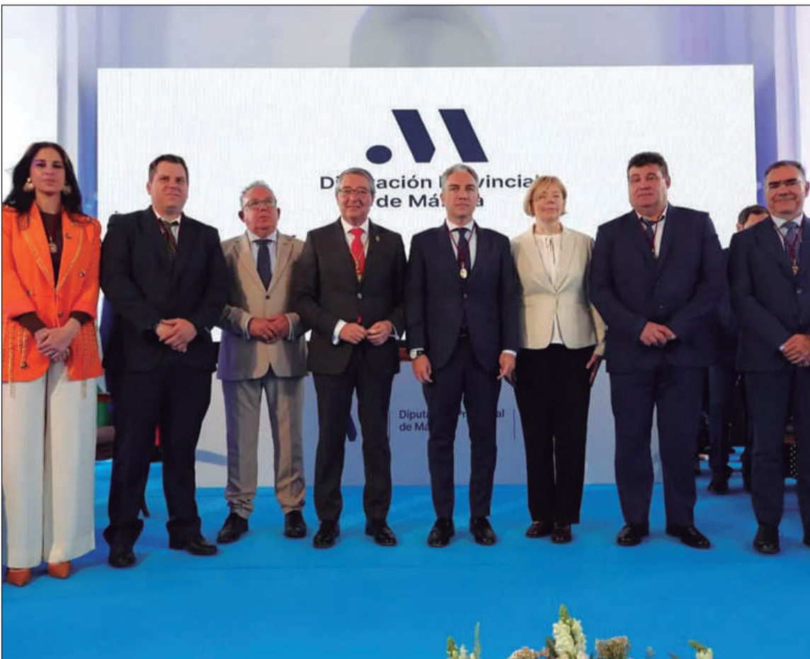
El presidente de la Diputación, con los homenajeados en el Día de la Provincia 2022.