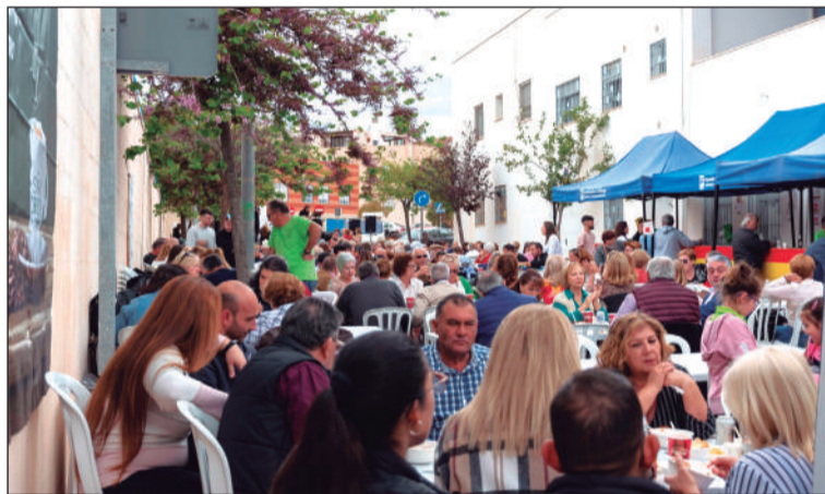
Gran ambiente en el desarrollo de la actividad.

• ASOCIACIÓN DE VECINOS COLONIA SANTA INÉS