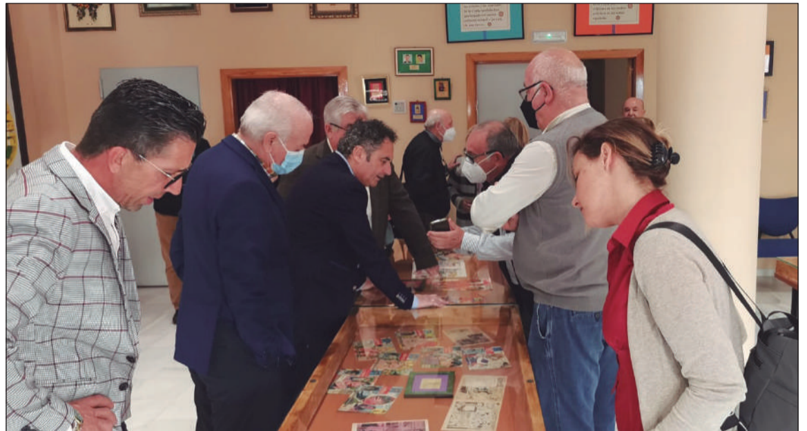
Imagen de la inauguración de la Sala de Usos Múltiples FEMAPE - Alcazaba.

Reiteramos el ofrecimiento a la Ciudad de Málaga de este espacio, y esperando contar con su respaldo para hacer realidad este ilusionante proyecto cultural recién iniciado.