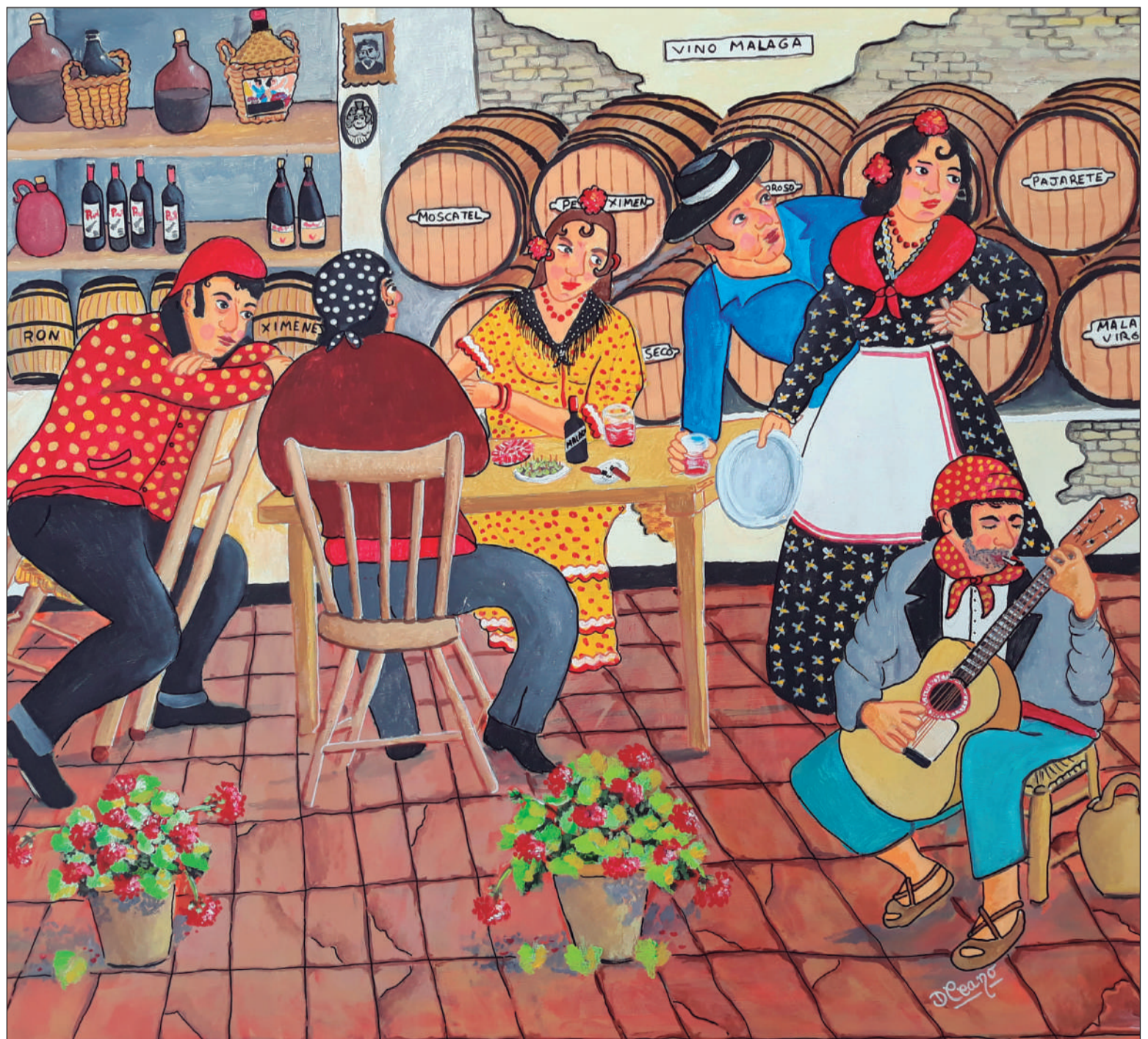
La taberna. Cuadro de Diego Ceano.

Como suele ser habitual, en Málaga, en esta ciudad con ingenio infinito, se hizo popular esta palabra que luego habría de incorporarse al vocabulario popular malagueño haciendo clara referencia al órgano sexual femenino.