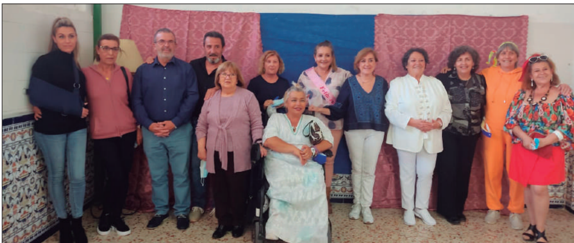
Socios de la Asociación de Vecinos Haniuca quisieron acompañar a los de Colonia Santa Inés.