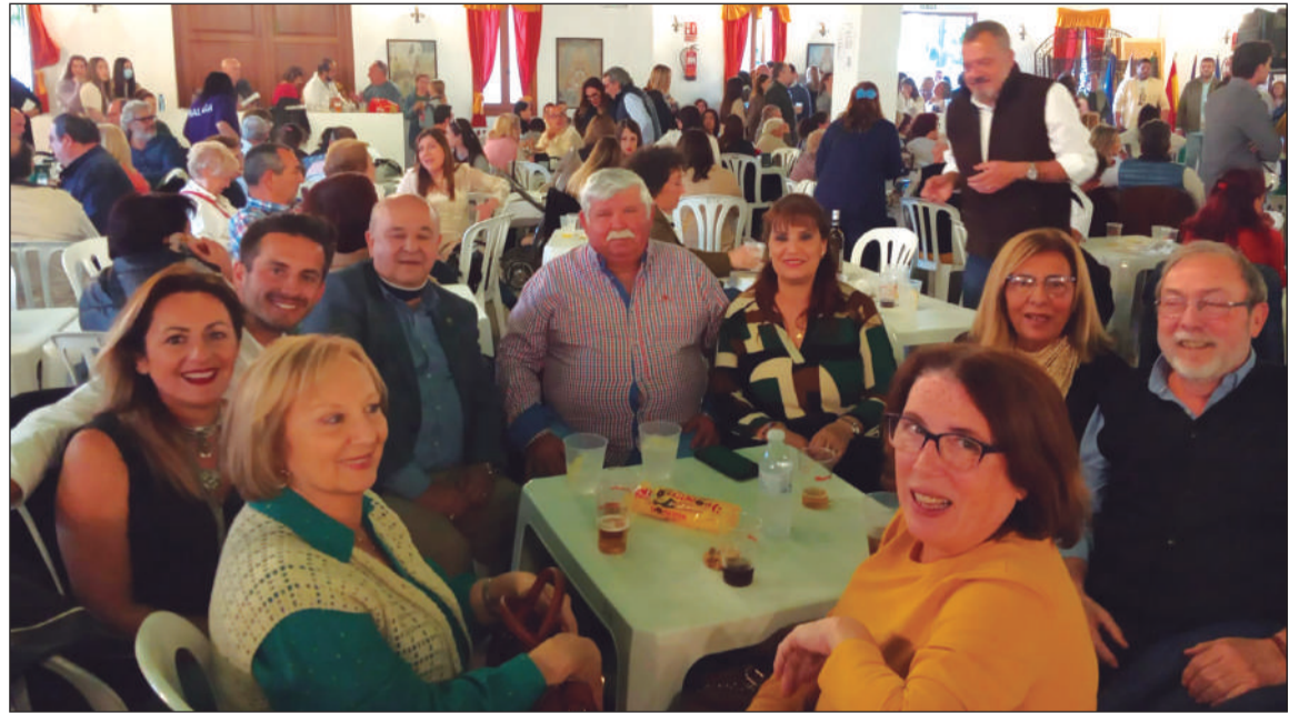
Representación peñista en la Pará Rociera.

«Después de tanto tiempo, hemos vivido un gran día de convivencia, parte fundamental y tan necesaria para todos los rocieros», señalaban desde la organización en lo que definían como «el inicio de un camino 2022 que todos esperamos impacientes, ahora queda preparar, para que el 28 de mayo iniciemos nuestro camino hacia la Virgen».