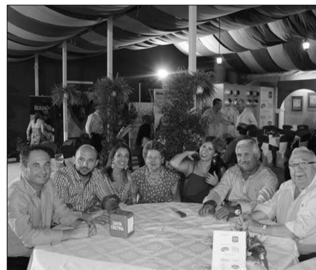
Concejales con el presidente de la Federación y su señora.