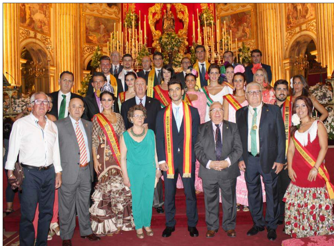
Ofrenda floral de la Federación Malagueña de Peñas a la Virgen de la Victoria en la Catedral.