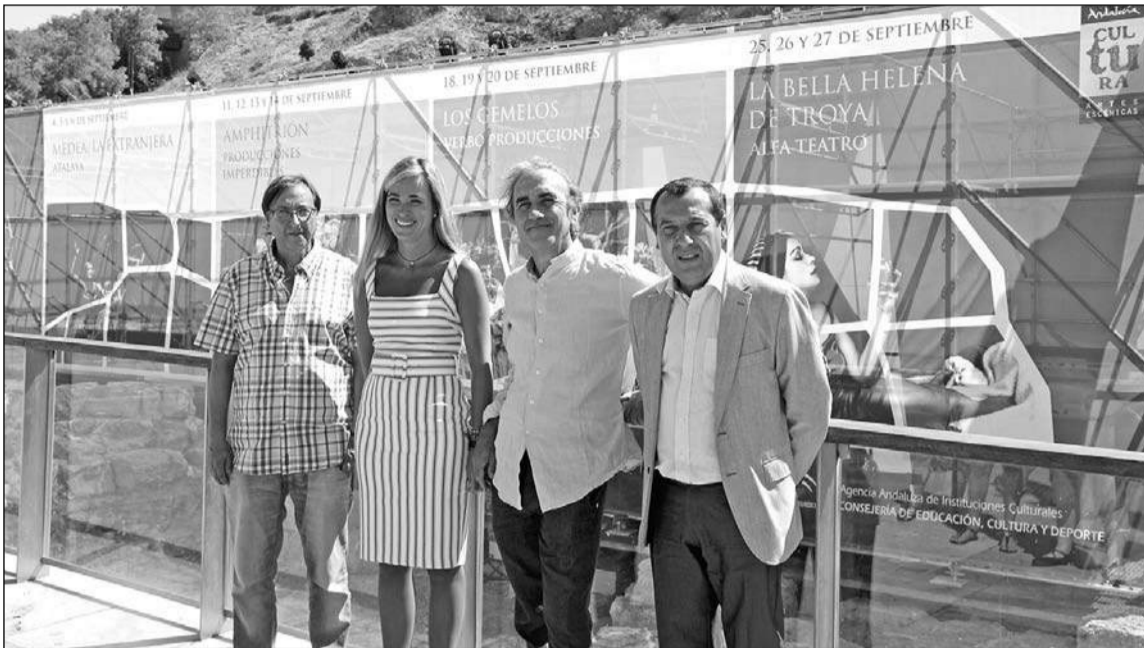
Presentación del ciclo teatral.