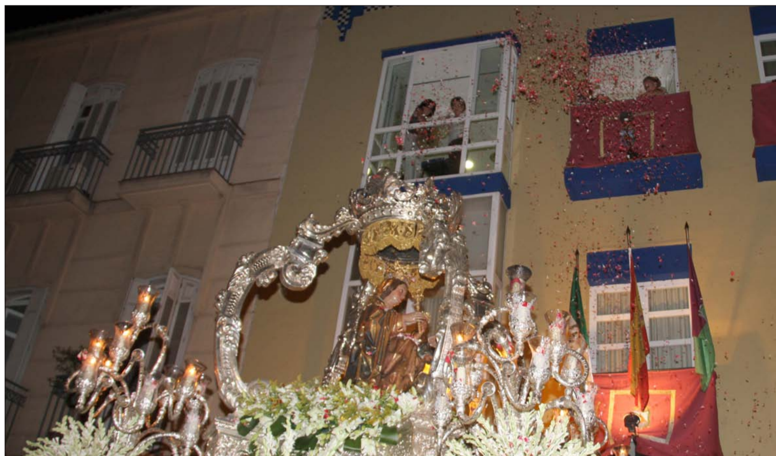
El colectivo peñista dedicó una petalada a la Patrona a su paso por su sede en la calle Victoria.

Número 557 10 de Septiembre de 2014 C/ Pedro Molina, 1 Tfno: 952 22 54 39 Fax: 952 21 48 82 E-mail: prensa@femape.com - la_alcazaba@hotmail.com Web: www.femape.com Edición digital: www.femape.com/laalcazabadigital Twitter: @FMPLaAlcazaba Búsquenos también en Facebook