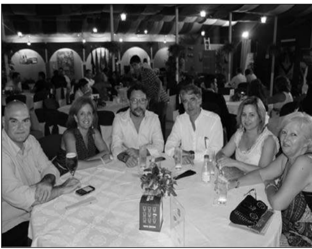
Visita del grupo municipal socialista.