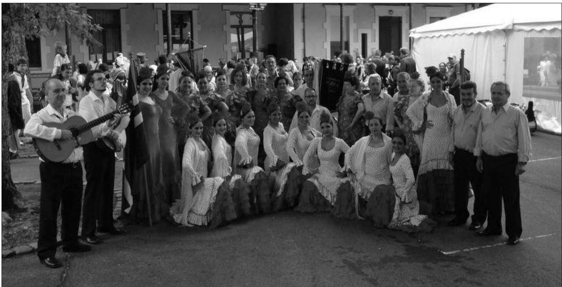
Integrantes de la agrupación, en la Feria de Dax.

El 19 de julio se celebraron en la gran feria de Dax, una de las más importantes de Francia, la Finca El Portón de Alhaurín de la Torre el XXI Festival Nacional de Folklore de Solera, con la presencia de la Agrupación Folklórica 'La Sidrina', de Lugones (Asturias); el Grupo de Coros y Danzas 'El Miajón', de Móstoles (Madrid); la Agrupación folclórica 'Raíces y Horizontes', de Alhaurín de la Torre; y el propio Grupo Folklórico Solera, como grupo anfitrión.