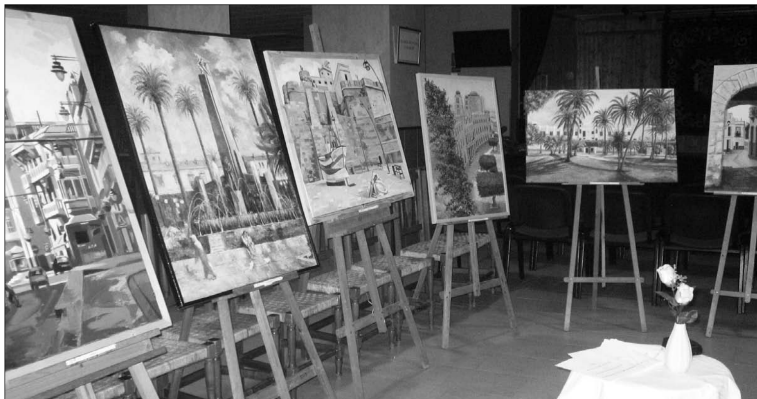
Exposición de obras presentadas en la edición de 2013.

Los participantes que hayan obtenido premio en dos Certámenes consecutivos, no podrán volver a concursar hasta transcurridos la celebración de dos certámenes posteriores al último premio obtenido.