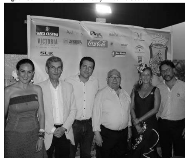
Invitados a la noche dedicada a Sabor a Málaga.