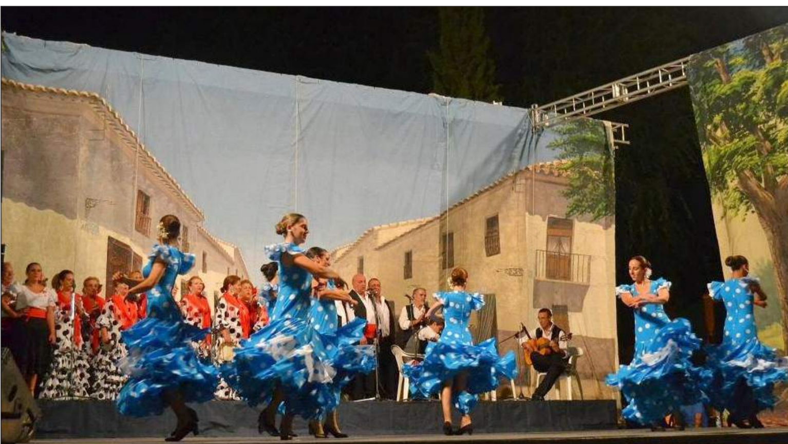
Un instante de la actuación de Raíces y Horizonte.

En su conjunto, fue un viaje de intercambio cultural que suma a su extensísimo currículum esta agrupación folclórica alhaurina en el que el compañerismo entre los miembros de Raíces, el buen humor y simpatía de éstos ha hecho que sea una experiencia inolvidable.