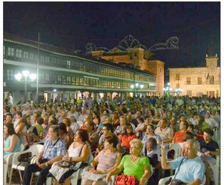
Aspecto que presentaba la plaza Mayor de Almagro.

Por la tarde se produjo la recepción oficial por parte de las autoridades locales en el singular entorno del patio del Convento de la Asunción de Calatrava, en el que el alcalde de la localidad daría la bienvenida a las agrupaciones invitadas produciéndose un intercambio de regalos, como acto de inicio del pasacalles encabezado por el mismo primer edil, ataviado con el traje típico, que