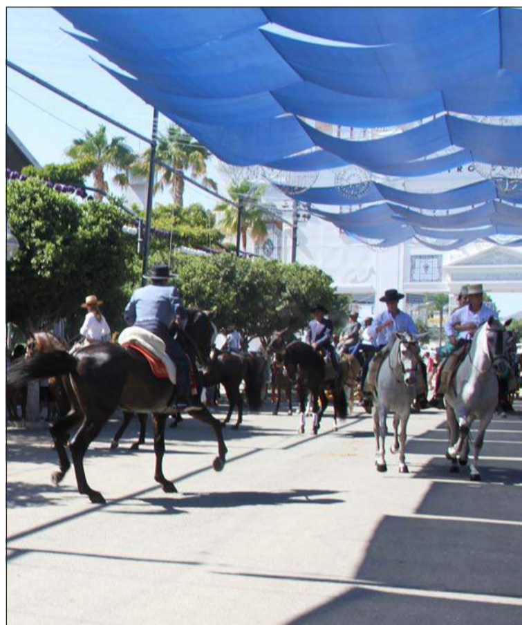
Caballos paseando por el real de Cortijo de Torres este año.

Entidades colaboradoras con esta publicación: