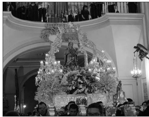
La Virgen de la Victoria, de nuevo en su templo.