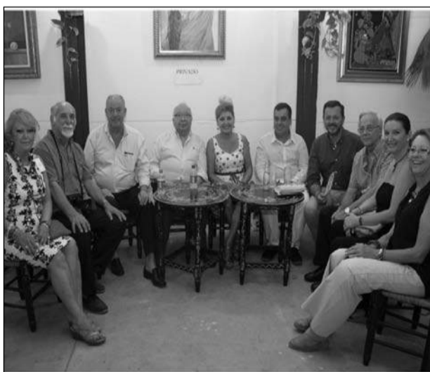
Visita a la caseta de la Peña La Paz.