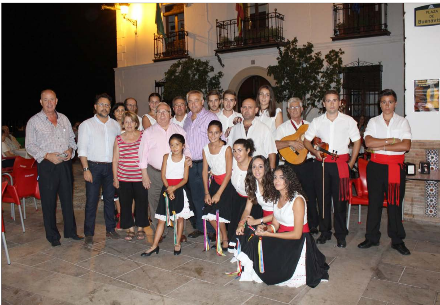
Directivos de la Federación de Peñas con el alcalde y componentes de la Panda de Verdiales.

Desde el Ayuntamiento de Casarabonela se quiso reconocer públicamente la participación de la Federación Malagueña de Peñas, Centros Culturales y Casas Regionales 'La Alcazaba', haciendo entrega de un recuerdo por parte de su alcalde al presidente del colectivo peñista.