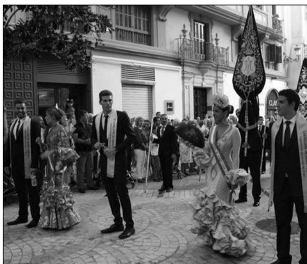
Damas y Caballeros de Honor, por la plaza del Carbón.