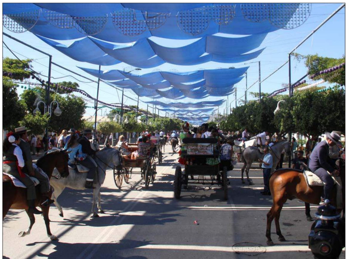
Caballos y enganches en una de las calles del real.

Por otra parte, el wifi gratuita disponible en el centro histórico y en Cortijo de Torres, ofrecida por PTV Telecom, ha registrado más de 250.000 conexiones, lo que supone una subida del 15 por ciento respecto a 2013. La red ha transferido casi 80Gb diarios.