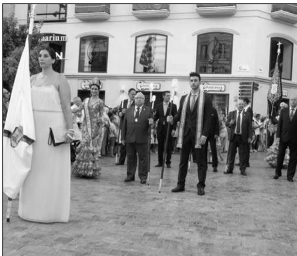
Representación peñista, por la plaza de la Constitución.