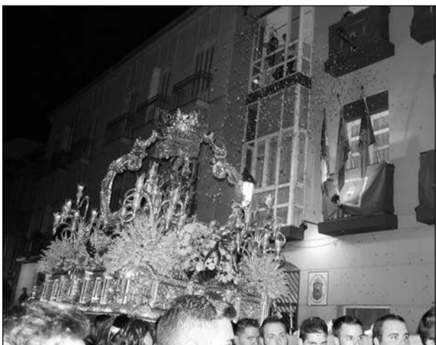
Petalada desde la sede de la Federación Malagueña de Peñas. Comitiva peñista, en el Santuario.