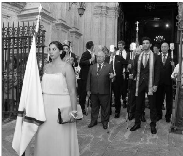
Salida de la procesión de la catedral.