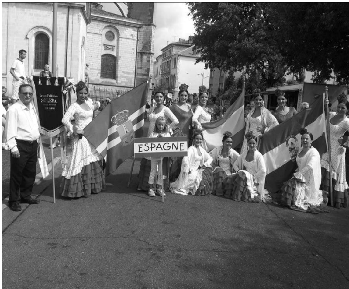
Grupo de Baile de Solera en tierras francesas, luciendo las banderas de Alhaurín de la Torre, España y Andalucía.

Aprovechando su participación en estos dos festivales, los participantes han podido conocer la región de Landes, así como disfrutar de sus bajas temperaturas en el caluroso agosto.