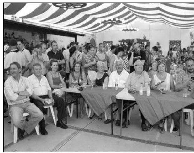
Jurado del I Concurso de Charangas.