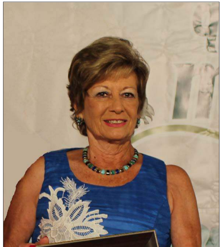
La presidenta, en la pasada Feria.

M.A.M.- Creo que la falta de incorporación de la juventud es un tema estrella para todas las peñas. Se trata de un gran problema para todos, aunque más en la capital que en los pueblos; donde creo que hay más involucración de los jóvenes al no tener tantas alternativas. La oferta de ocio en Málaga es infinita, y