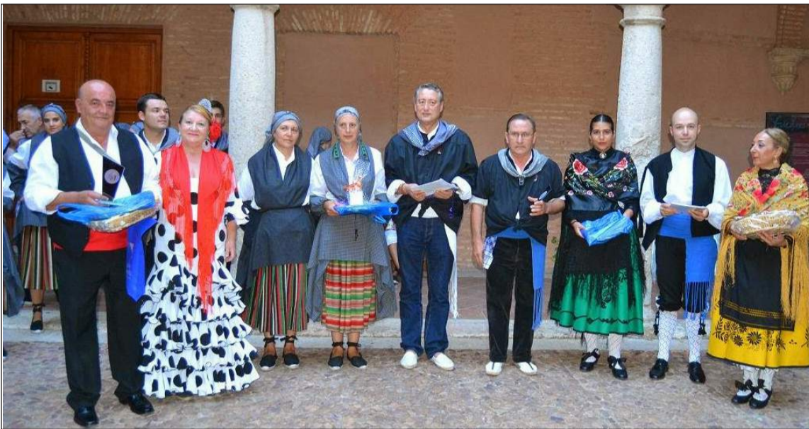
Representantes de los grupos participantes.