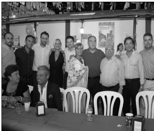
Autoridades asistentes al Concurso de Mantones.