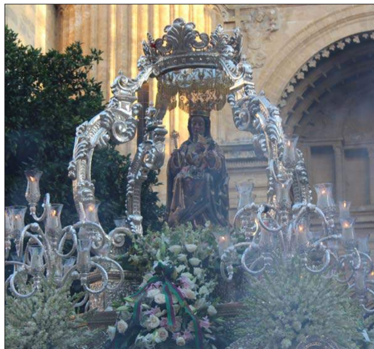
Santa María de la Victoria, en su trono, a la salida de la Catedral.