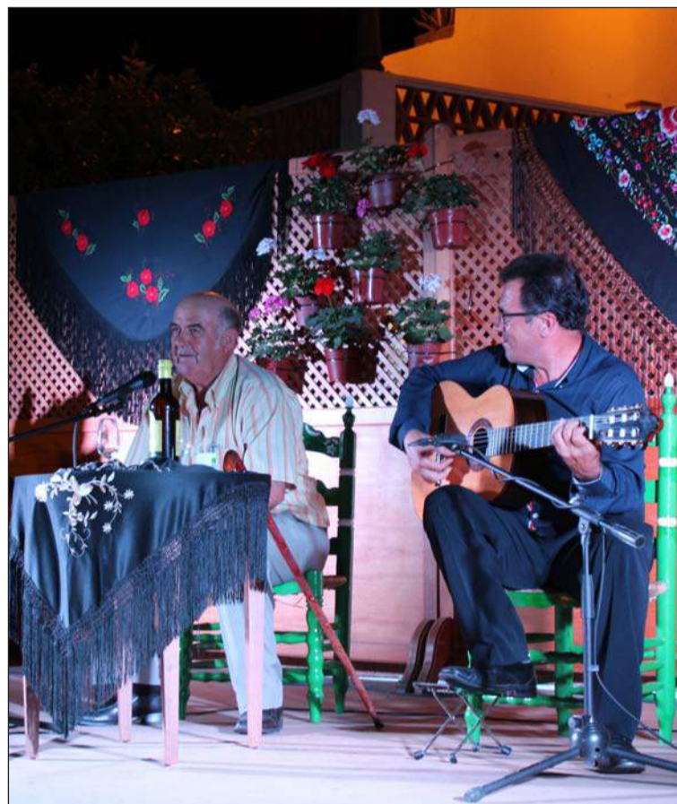
Una de las actuaciones flamencas.