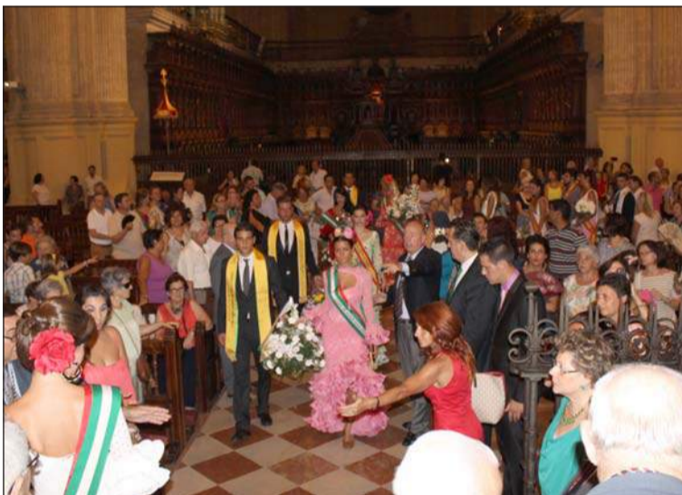
Se contó con una gran participación de entidades.