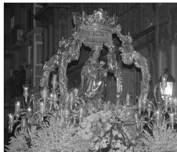
La Patrona, ya de regreso por calle Victoria.