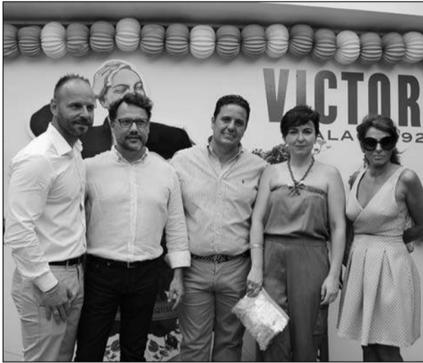
Caseta de Cervezas Victoria en el Restaurante Alea.