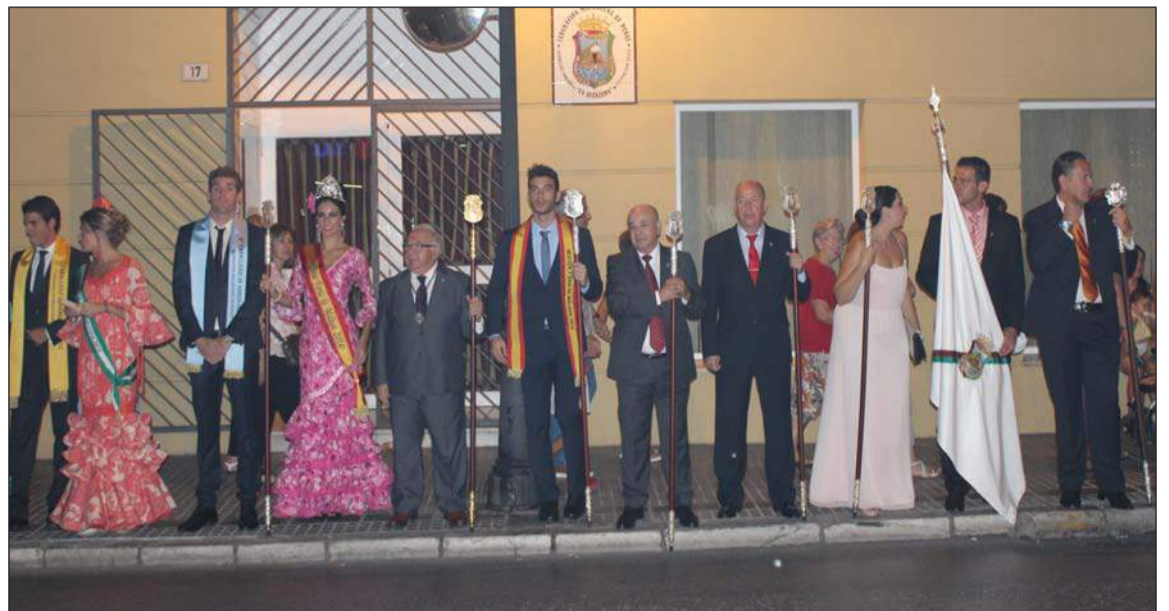
Esperando el paso del trono por la puerta de la sede de la Federación Malagueña de Peñas.

Los frailes fundaron allí la casa Matriz de la Orden Mínima en España y desde aquí comenzaron a expandirse. Por expreso deseo de los Reyes Católicos recibieron el sobrenombre de 'Victorios' y fundaron la gran mayoría de los conventos en honor a la malagueña Virgen de la Victoria; que continua siendo abogada de los Mínimos.