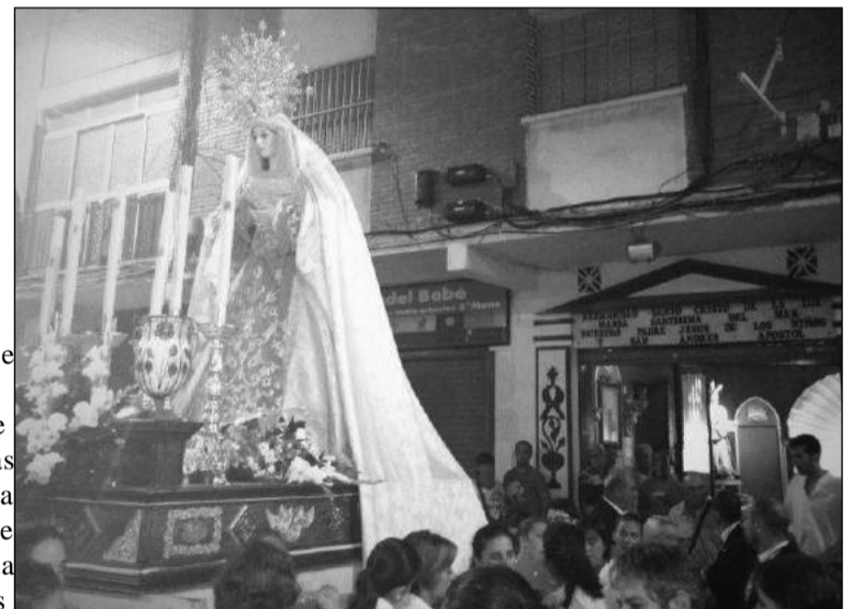
Entrada de la Virgen a su capilla.