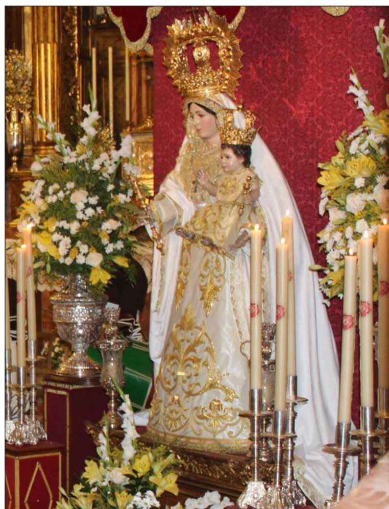
La Virgen de la Alegría, el pasado fin de semana en la Divina Pastora.