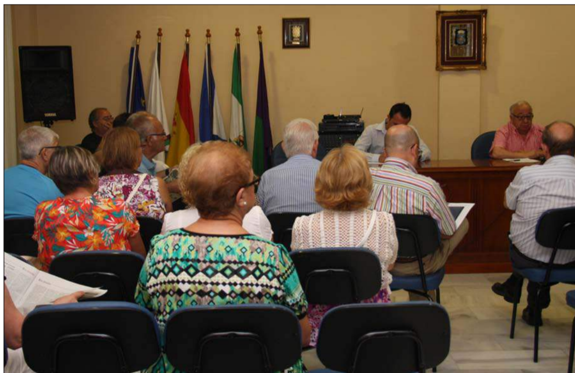
Asamblea post feria del pasado año 2013.

En el orden del día se incluyen dos únicos puntos, el análisis de la Feria 2014, y ruegos y preguntas. Los presidentes o representantes de las entidades federadas están citados a las 20:30 horas en primera convocatoria, y a las 21:00 en segunda.