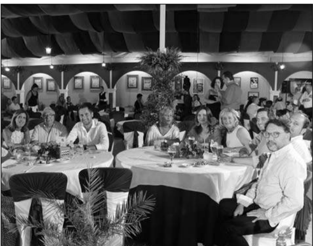
Concejales del Ayuntamiento de Málaga en la Caseta.