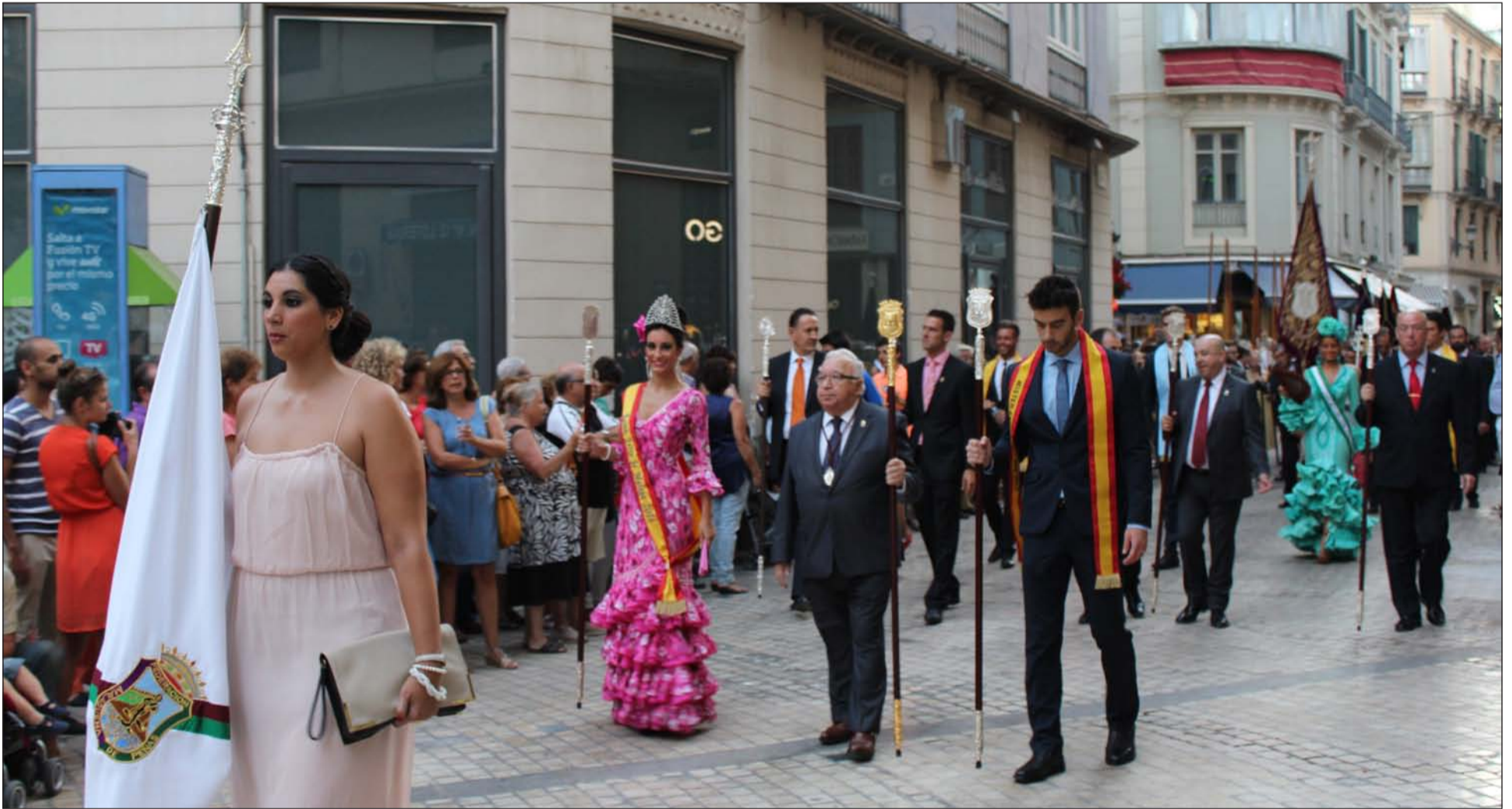
Comitiva peñista en la procesión de la Victoria, a su paso por la calle Larios.

A la Virgen le acompañó la Banda del Real Cuerpo de Bomberos de Málaga, la Banda de Cornetas y Tambores de Santa María de la Victoria, la Banda Municipal de Música y la de la cofradía de la Expiración, así como diversas autoridades, entre las que destacaron representantes del Ayuntamiento y de la Diputación que van cercanos al trono por ser hermanos mayores