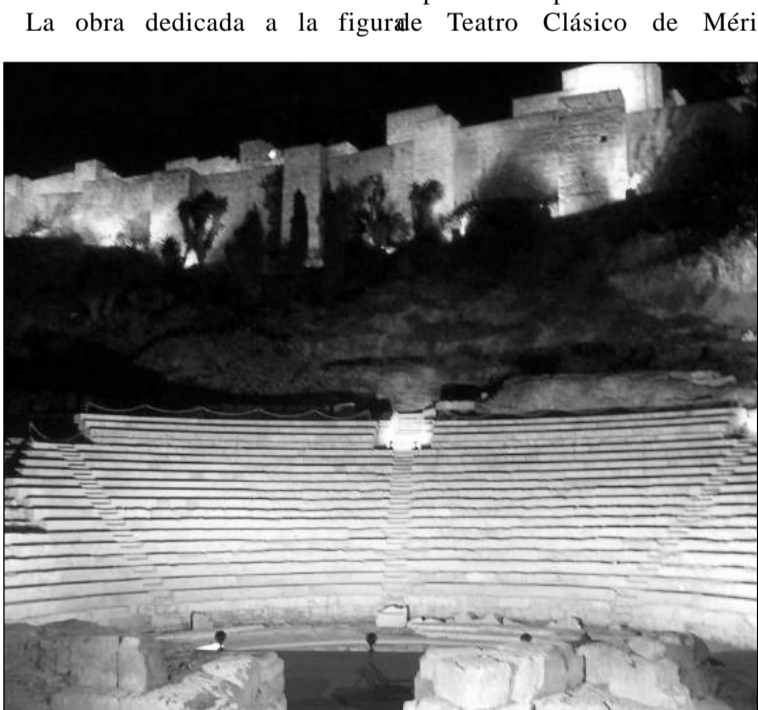
Vista nocturna del teatro Romano.

El Teatro Romano, construido en el siglo I y oculto hasta 1951, recupera este mes de septiembre su esencia escénica con la programación de cuatro obras de teatro clásico grecolatino. El ciclo teatral incluye interpretaciones corales con partituras musicales que datan desde el siglo I hasta 1951, recuperando obras representadas en un espacio escénico con un programa de cuatro obras de teatro clásico grecolatino. El ciclo teatral incluye interpretaciones corales con partituras musicales que datan desde el siglo I hasta 1951, recuperando obras representadas en un espacio escénico con un programa de cuatro obras de teatro clásico grecolatino. El ciclo teatral incluye interpretaciones corales con partituras musicales que datan desde el siglo I hasta 1951, recuperando obras representadas en un espacio escénico con un programa de cuatro obras de teatro clásico grecolatino.