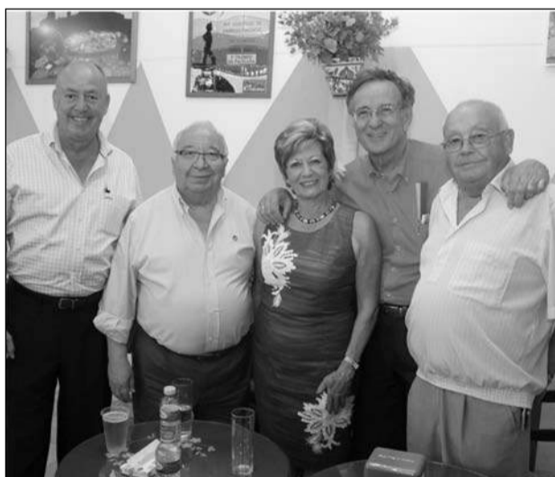
Visita a la caseta de la Casa de Álora Gibralfaro.