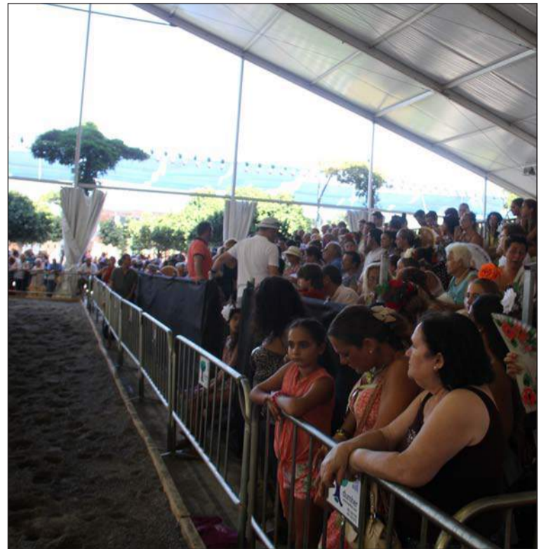
El Centro de Exhibiciones Ecuestres ha sido punto de atracción en el real.

Más de 20.000 personas han asistido a los 45 conciertos promovidos por el Área de Juventud, en la caseta del Real. Han sido alrededor de un centenar de artistas y bandas las que han actuado en este escenario donde se ha apostado, un año más, por el fomento de la creación artística de los jóvenes malagueños mediante concursos de creación y fotografía, así como, por la promoción cultural a través de la Noche de las Oportunidades y la final de MálagaCrea Rock 2013. Además, en el puesto de información del Servicio de Atención a la Movida (SAM) se han repartido más de 5.000 abanicos con mensajes preventivos sobre el consumo de alcohol y drogas, así como información sobre las enfermedades de transmisión sexual y cómo evitarlas. Además se han realizado exposiciones de trajes de flamenca, concurso de jóvenes creadores y sorteo bono EMT.