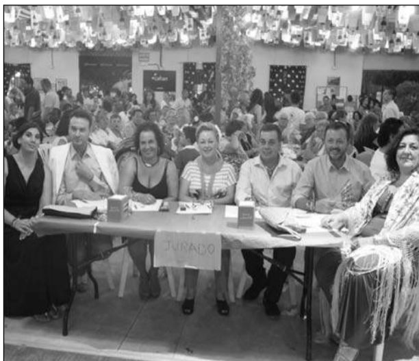
Jurado del Concurso de Mantones de Manila.