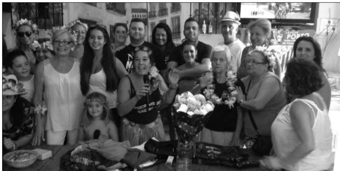
Socios disfrutando de la Fiesta Tropical del pasado lunes.

El pasado lunes 8 de septiembre, aprovechando la jornada festiva de la Virgen de la Victoria en nuestra capital, desde la junta directiva de la Peña La Solera se convocó a los socios para darse cita en su sede para disfrutar de una agradable Fiesta Tropical que estuvo marcada por el buen humor y la simpatía de todos los componentes de esta entidad perteneciente a la Federación Malagueña de Peñas, Centros Culturales y Casas Regionales 'La Alcazaba'.