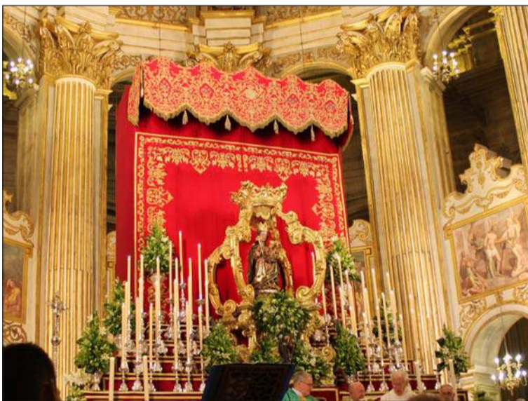
La Virgen de la Victoria presidía el altar mayor.