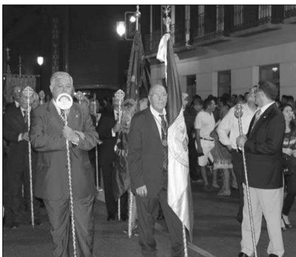
Representantes de Hermandades de Gloria.