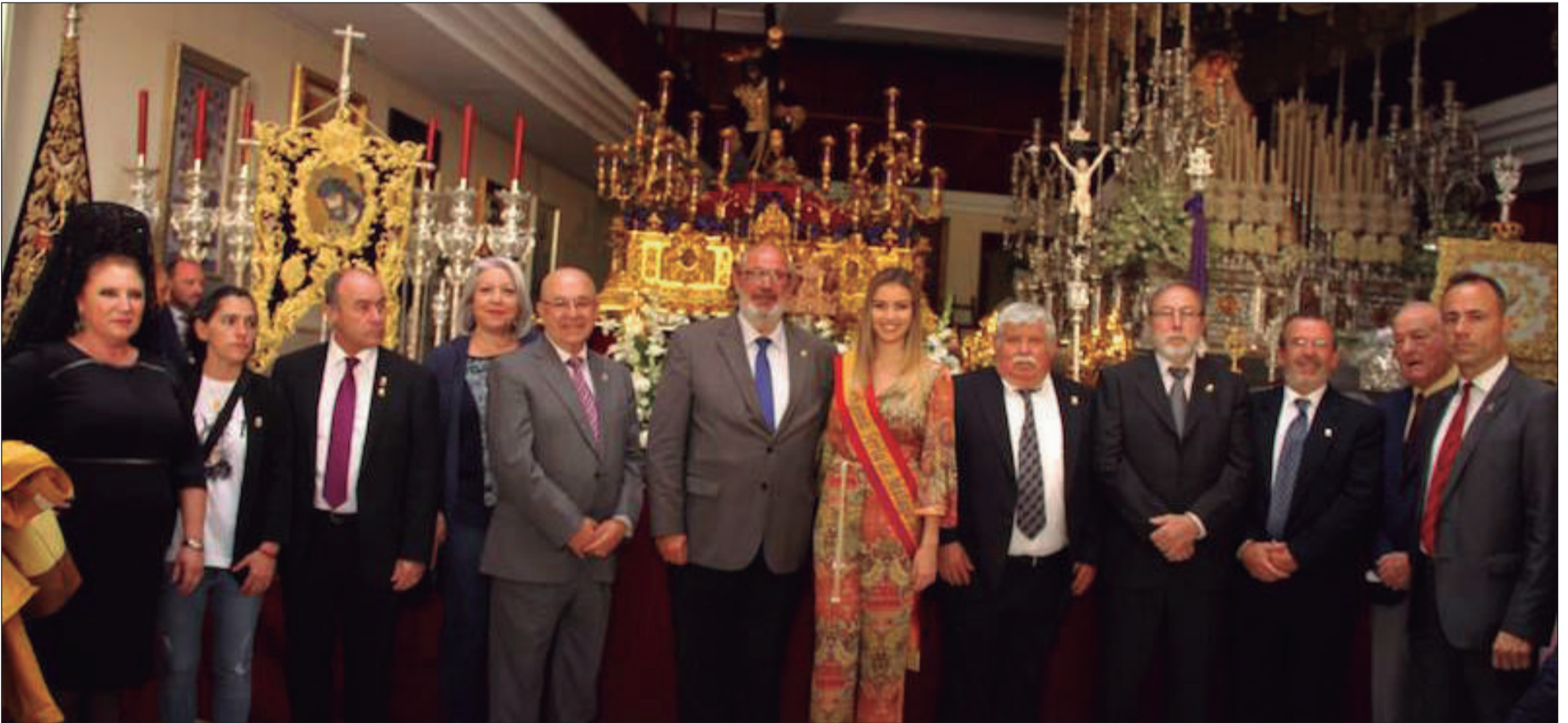
Última Ofrenda Floral 'Un clavel para el Rocío' celebrada el Lunes Santo de 2019.

• FEDERACIÓN MALAGUEÑA DE PEÑAS, CENTROS CULTURALES Y CASAS REGIONALES 'LA ALCAZABA'