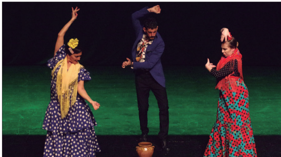
Un instante del espectáculo.