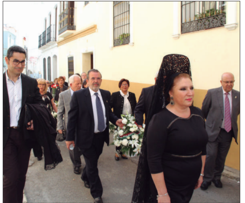
Peregrinación a la Casa Hermandad del Rocío en 2019.

honor. Para ello se solicita que acudan ataviadas con mantilla y con su Banda de Reina (sin la Corona), aportando así mayor vistosidad al evento. Así, desde la Federación Malagueña de Peñas se pretende dar más realce a este acto; así como potenciar el uso de esta prenda tan tradicional en las procesiones de Semana Santa de toda España.