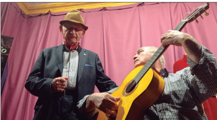
Cante flamenco en esta actividad.