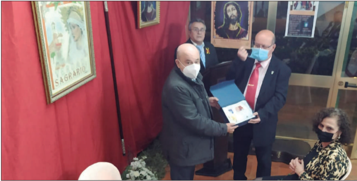
El presidente de la Federación de Peñas acompañó a los socios de la Peña Recreativa Palestina en este acto cofrade.