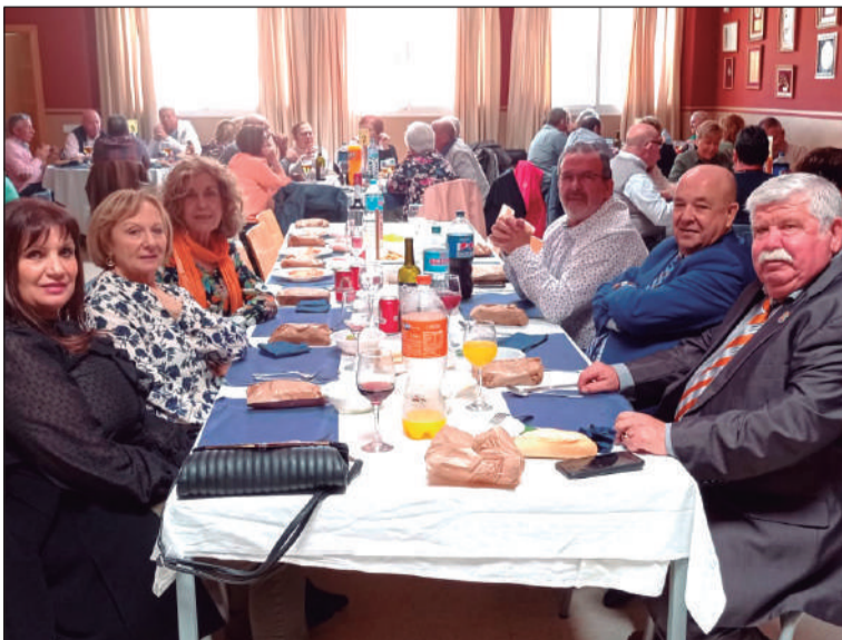
El presidente y directivos de la Federación acompañaron a los socios.