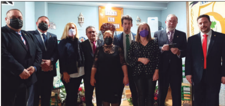
Imagen del acto celebrado en la sede de la Peña El Parral.

Para la decoración de la sede se contaba con la colaboración de la Cofradía del Nazareno del Perdón y María Santísima de Nueva Esperanza, que cedía algunos enseres.