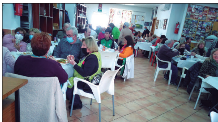
Vista general de la sede durante la actividad.