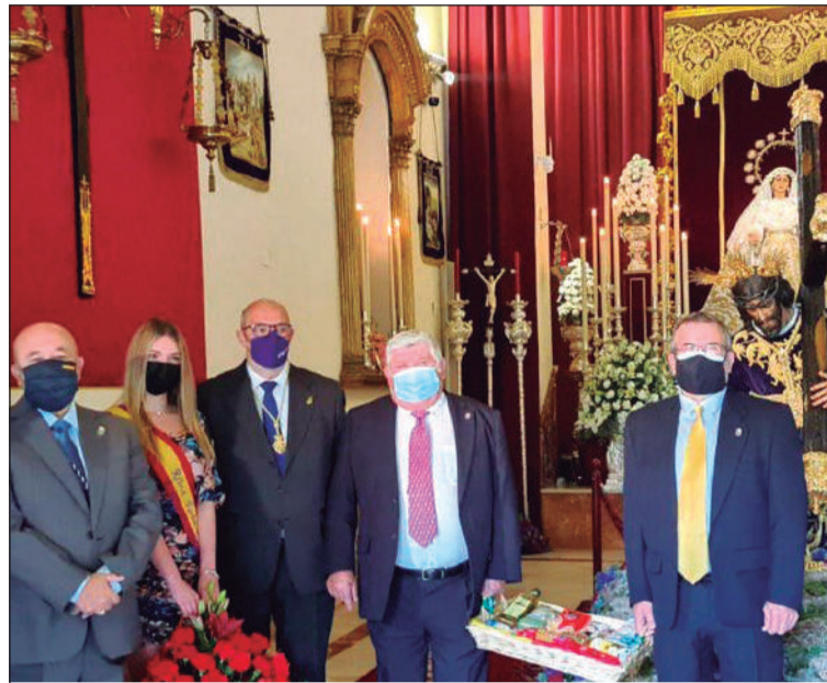
La Ofrenda Solidaria a la Cofradía del Rocío el pasado año.

Con el deseo de que todas las hermandades puedan cumplir con todo lucimiento sus Estaciones de Penitencia, invitamos a toda Málaga a vivir su Semana Mayor.