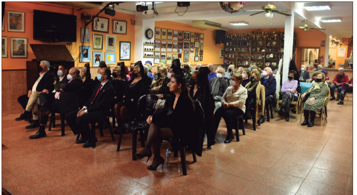
Vista general del salón de la entidad durante la XXV Exaltación de la Mantilla.

• ASOCIACIÓN RECREATIVA Y CULTURAL EL PORTÓN