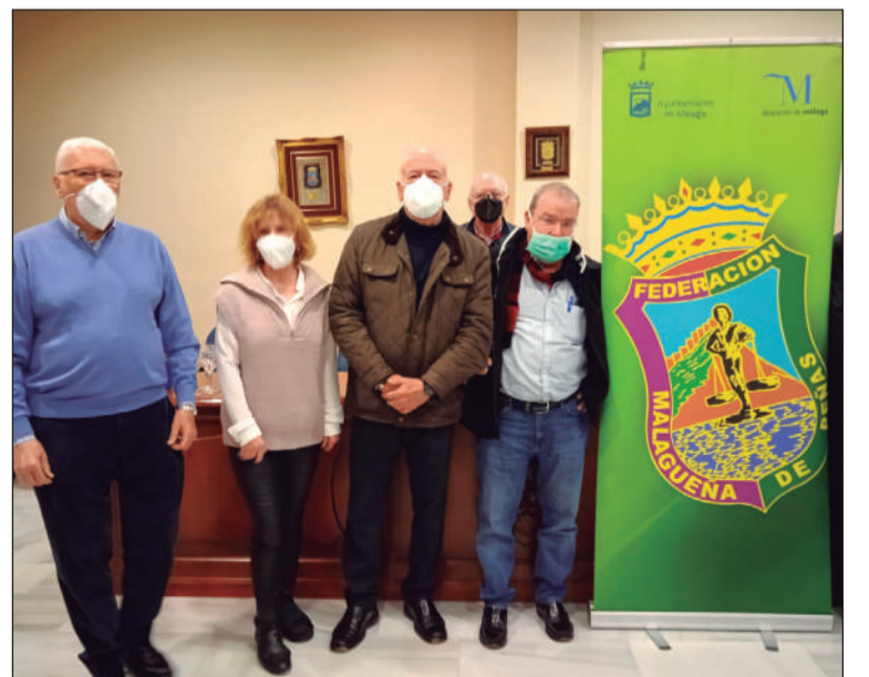
Directivos de El Portón con el relaciones públicas de la Federación.

El salón de actos de la sede peñista acogía esta reunión en la que se abordaban diversos temas de interés para entidad tan emblemática en la Feria de Málaga.