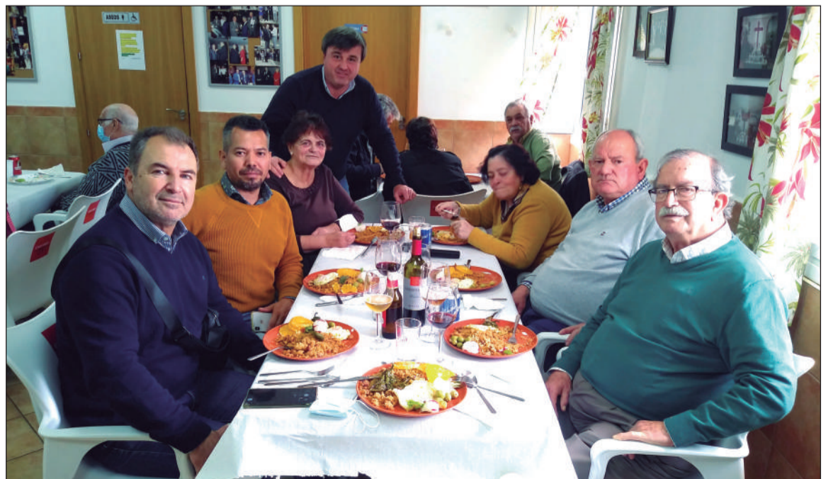
Asistentes a las Migas Solidarias promovidas por la Peña Montesol Las Barrancas.