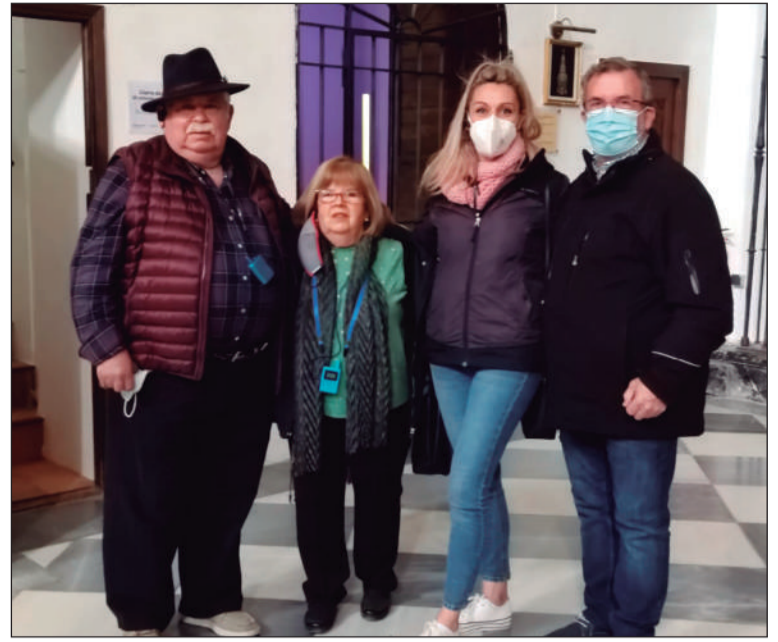
La visita tenía lugar el pasado fin de semana.