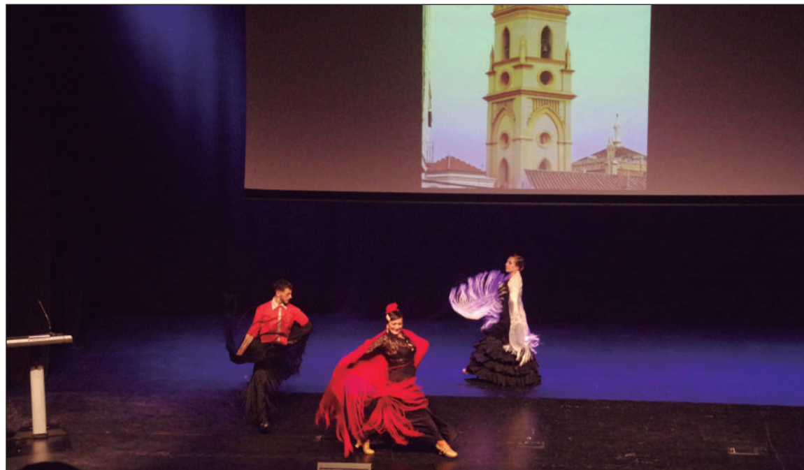
La Torre de San Pablo, siempre presente en 'Pasión en la Trinidad'.

No faltaba la música, con la interpretación de marchas como Soledad de San Pablo, dedicada al la Cofradía del Santo Traslado, Crucificado de San Pablo a la Hermandad de la Salud con simbología e interpretación del 'cántaro de agua'. Amargura Coronada a Zamarrilla con simbología e interpretación de la rosa y el puñal, Alma de la Trinidad y Coronación de la Trinidad, a los Titulares de la Cofradía del Cautivo; resultando el conjunto un rotundo éxito que fue despedido con un gran parte de todos los asistentes.