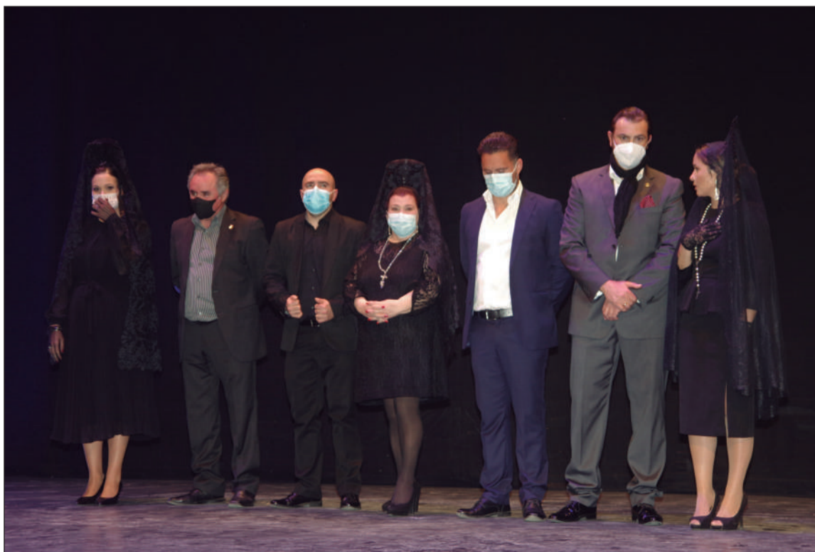
Finalistas del Concurso Nacional de Saetas 'Ciudad de Málaga'