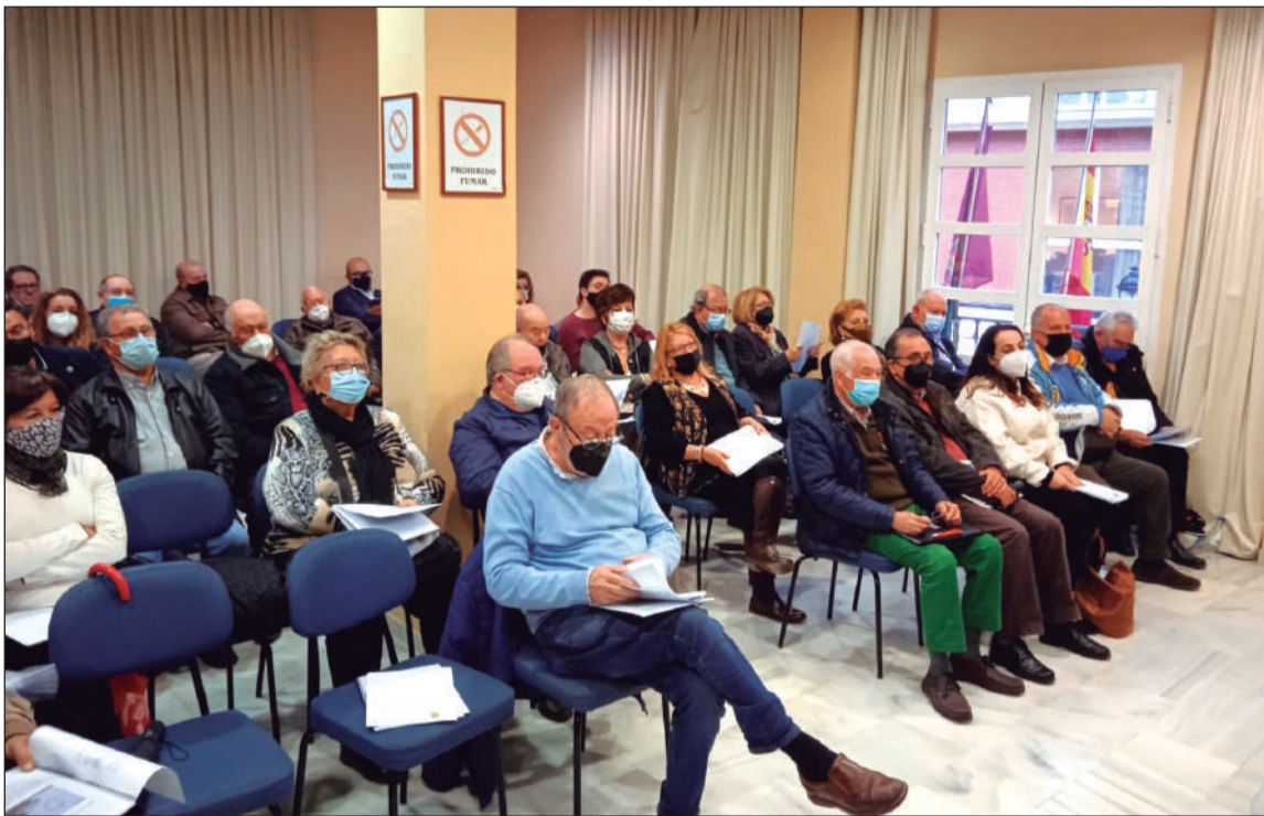
Representantes de las entidades en la sede de la Federación Malagueña de Peñas.

• FEDERACIÓN MALAGUEÑA DE PEÑAS, CENTROS CULTURALES Y CASAS REGIONALES 'LA ALCAZABA'