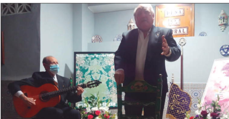
La saeta, presenta en este acto.