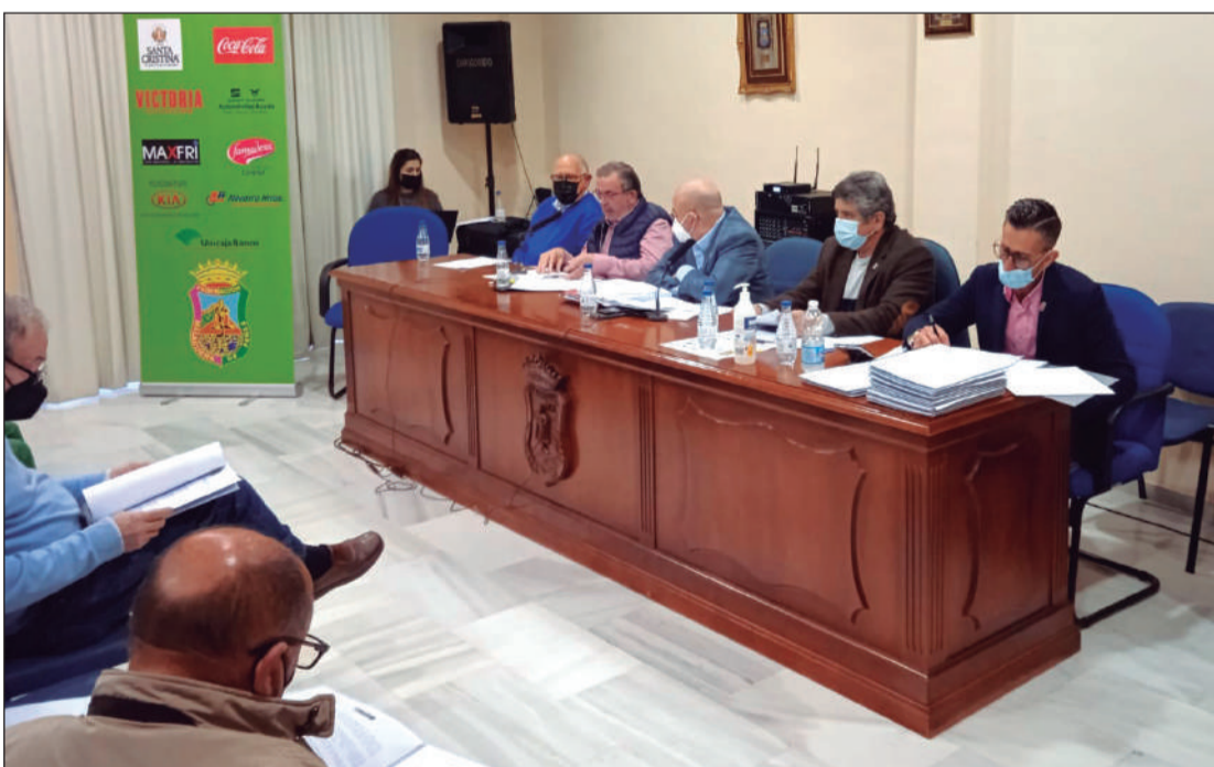
La Federación Malagueña de Peñas celebraba este lunes 4 de abril su Asamblea General Ordinaria en su sede.