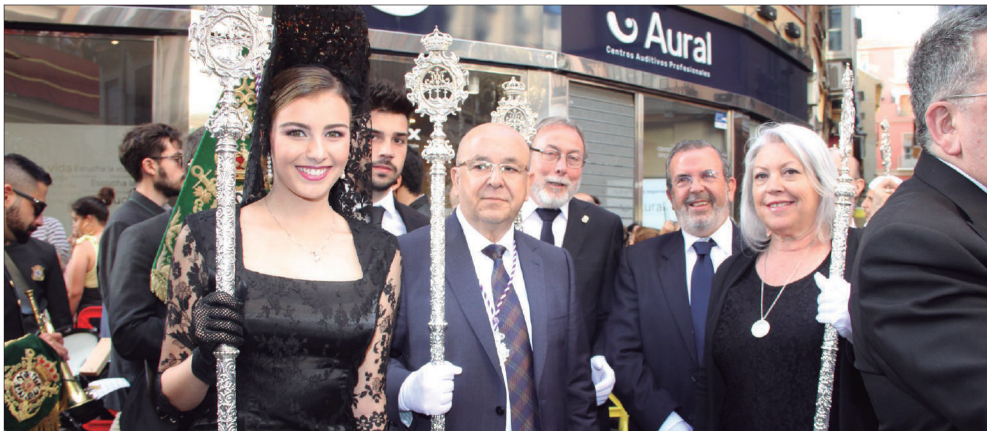
Representación peñista en la última procesión de la Cofradía del Rocío.

Hay cosas que son exclusivamente malagueñas