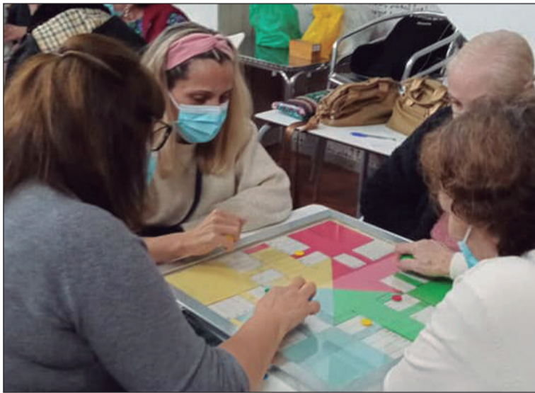
Disputa del Campeonato de Parchís.