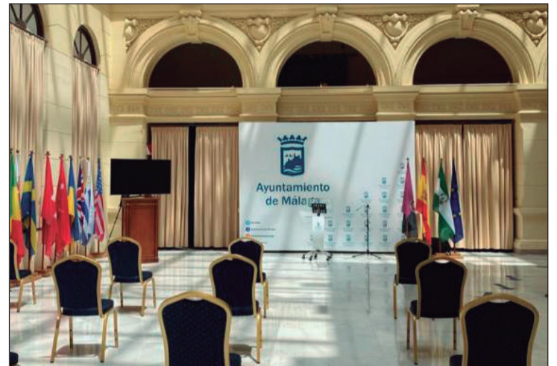
El Patio de Banderas del Ayuntamiento de Málaga acogerá este acto.

La decisión del Jurado será inapelable; reservándose la organización el derecho de modificar cualquier punto, en interés de dicho Certamen.