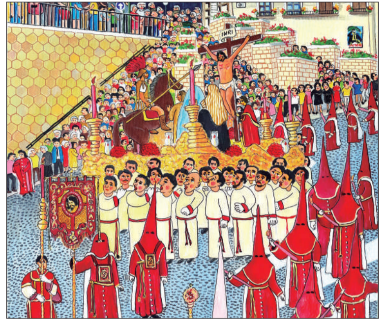
La Tribuna de los Pobres, por Diego Ceano.