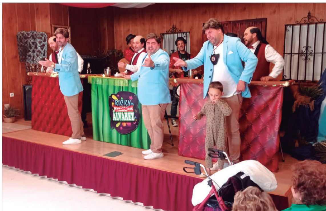
Intervención de la Murga 'De bar en peor'.