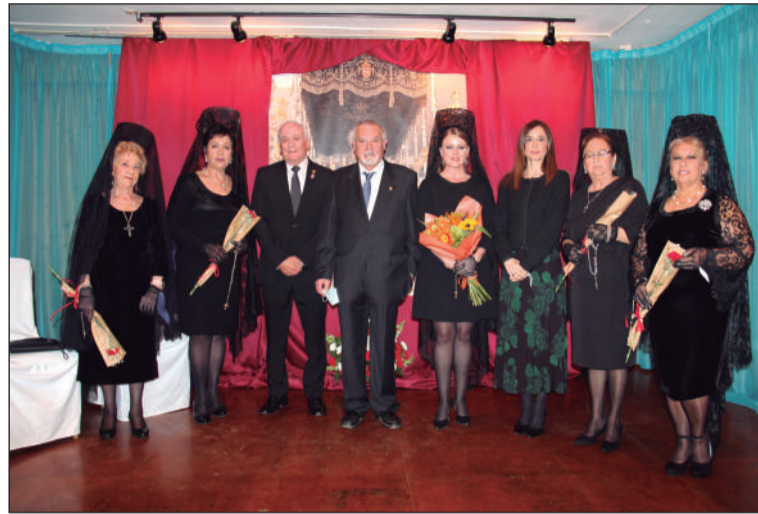
Imagen del acto celebrado en la sede de la Casa de Melilla.