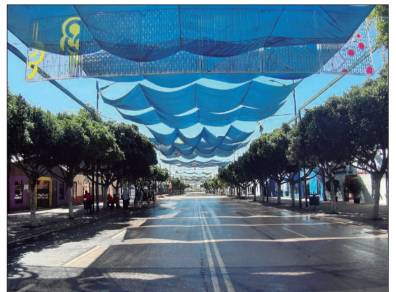
Cortijo de Torres retomará su actividad con presencia peñista.