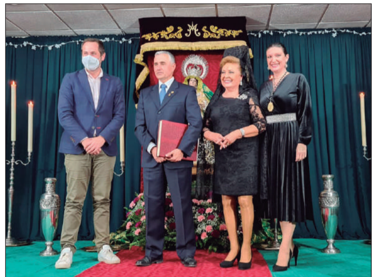
Exaltación cofrade en la sede de la Peña La Paz.