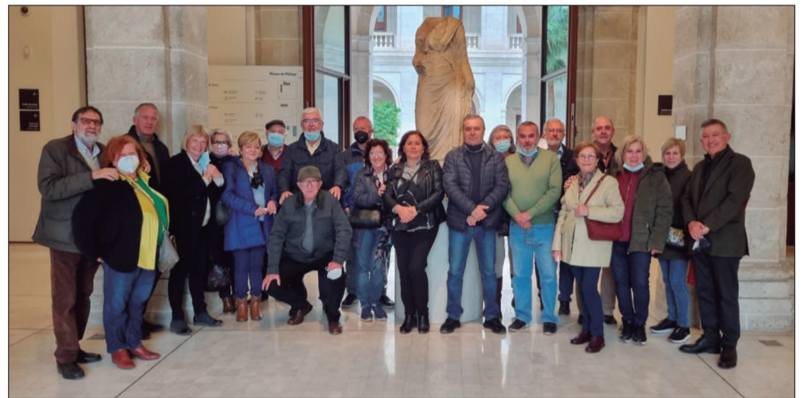
Visita al Museo de Málaga.