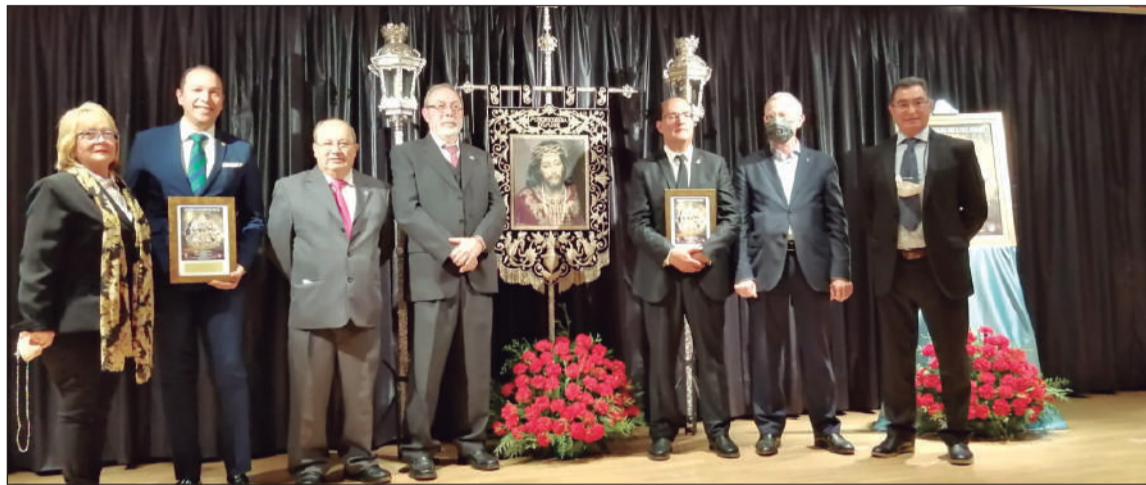
Imagen del acto celebrado en el salón de la ONCE.

res cedidos por la Cofradía de la Misericordia, representada en el acto junto a las demás hermandades perchelera; así como el direc-