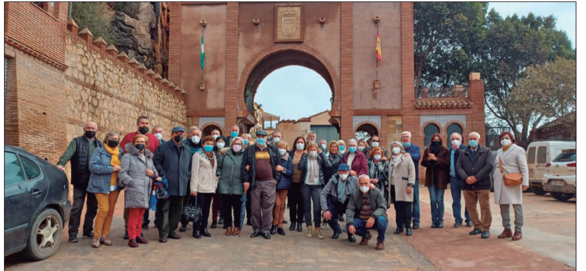
Socios en Comares.

Por otro lado, el día 29 de marzo, incluida en el programa de visitas culturales que la Agrupación Cultural Telefónica tiene programado para el presente año, se llevó a cabo por segunda vez la organizada al Museo Provincial de Málaga, esta vez para contemplar su colección arqueológica.