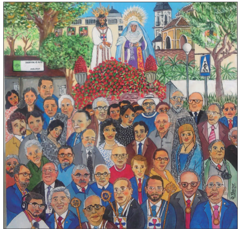
El traslado del Cautivo, por Diego Ceano.