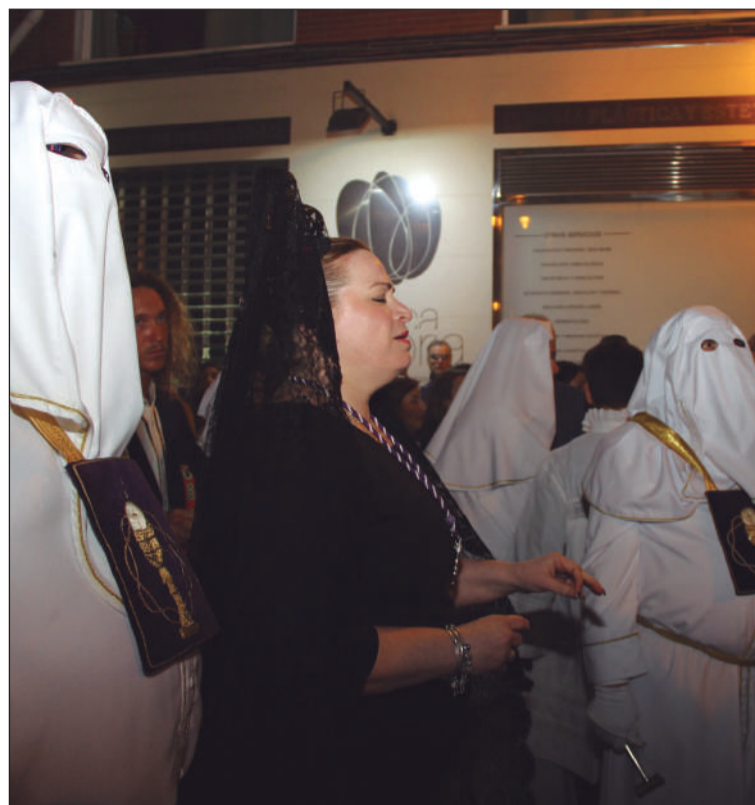
Saeta a la Virgen del Rocío en 2019.

La junta directiva de la Federación aguardará a la llegada del cortejo en puertas de su sede social, que durante toda la Semana Santa estará engalanada para el paso de las diferentes cofradías victorianas, y se les realizará esta oración cantada a pie de trono, y sin megafonía para ganar en el recogimiento propio de nuestra Semana Santa.