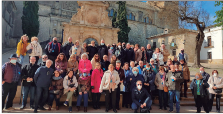
Imagen de grupo durante la excursión.

Así, además de la propia capital, los socios pudieron conocer otros municipios como Linares, Úbeda y Baeza.