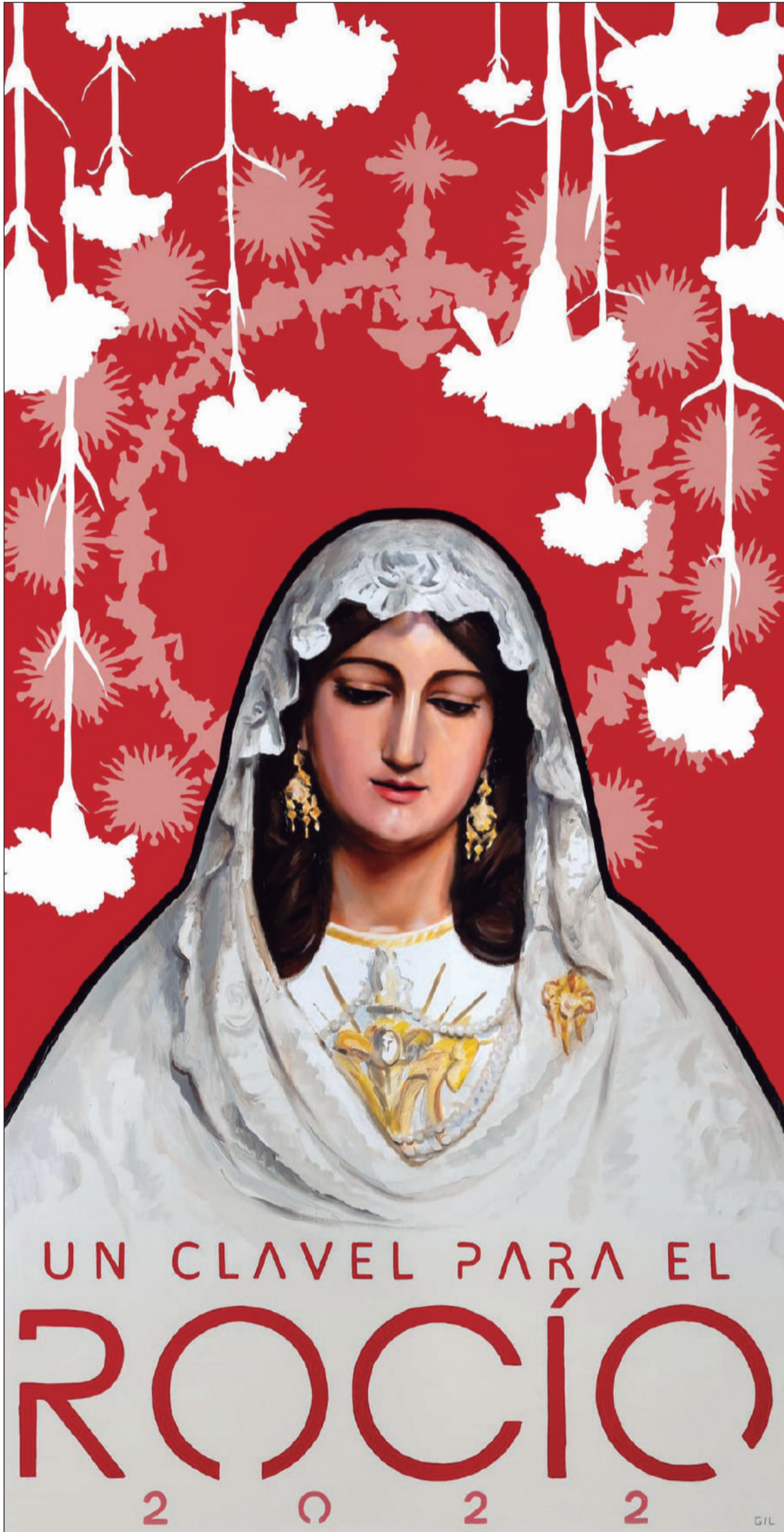
Cartel de la Exaltación 'Un Clavel para el Rocío' 2022, obra del artista Ricardo Gil.