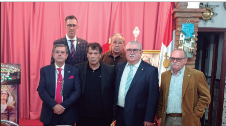
Participantes en la exaltación.