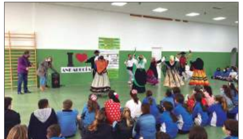
Muestra en el Colegio Medalla Milagrosa.