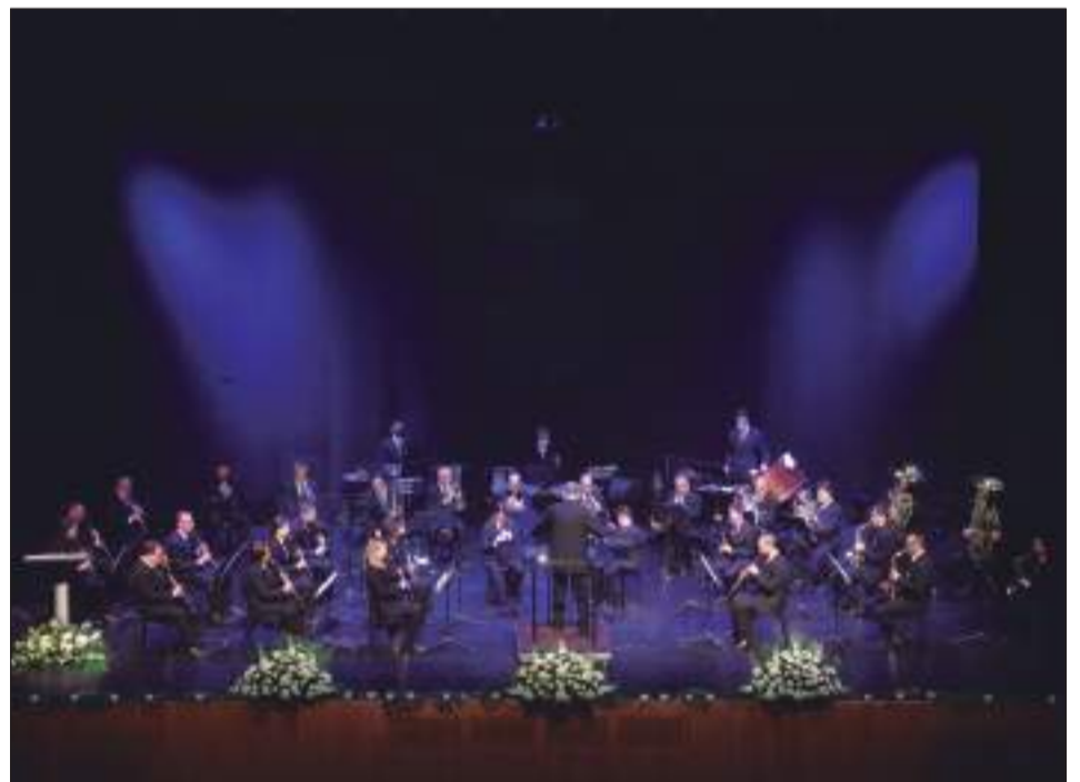
La Banda Municipal de Málaga cerró el acto con un recital y la interpretación de himnos.