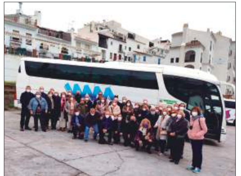
Excursión a Frigiliana.