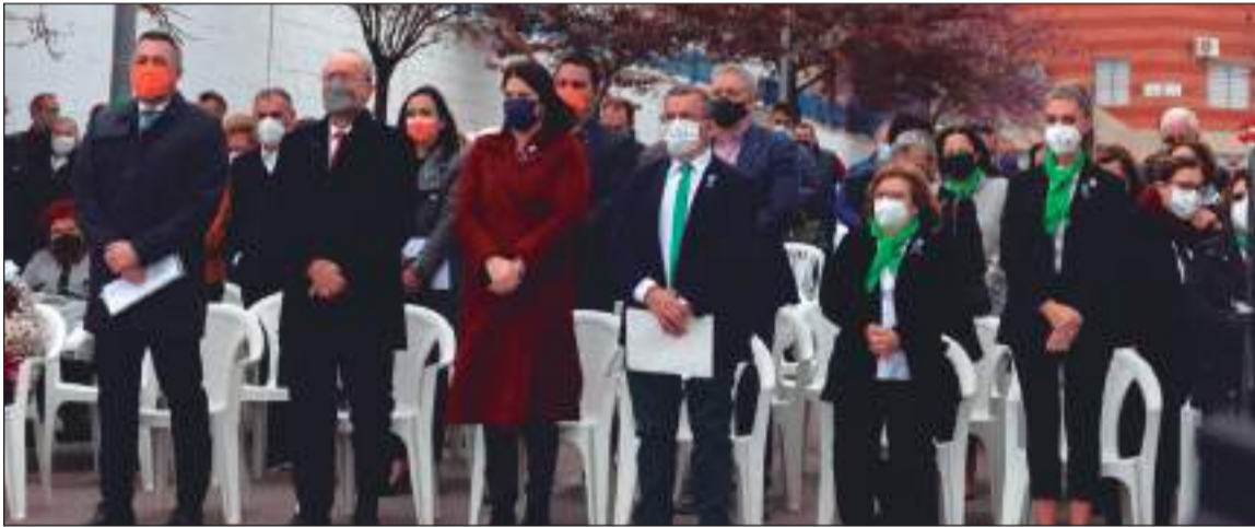
El acto contaba con bailes regionales, pregón, himno y aperitivos.