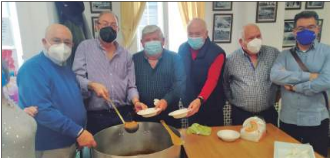
El presidente de la Federación y miembros de su directiva acompañaron a los socios de la Peña Perchelera.