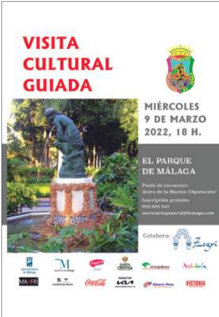
Cartel de la visita al Parque.

• FEDERACIÓN MALAGUEÑA DE PEÑAS, CENTROS CULTURALES Y CASAS REGIONALES 'LA ALCAZABA'