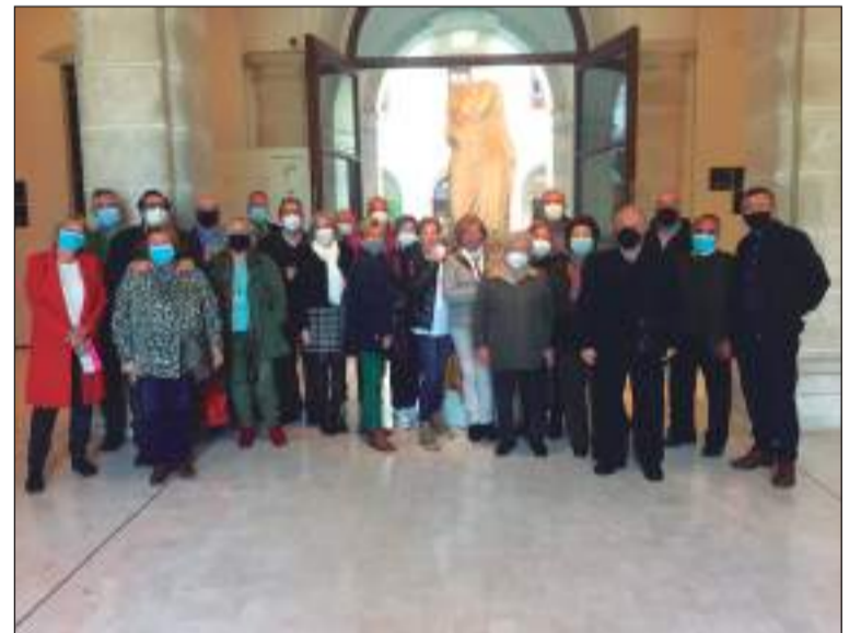
Visita al Museo de Málaga.

Y para terminar el mes de febrero y con ocasión del Día de Andalucía, en la sede de la entidad se ofreció gratuitamente un arroz para todos los socios que quisieron unirse a la celebración. Tras el almuerzo, se entonó emotivamente por todos los asistentes el Himno de Andalucía.