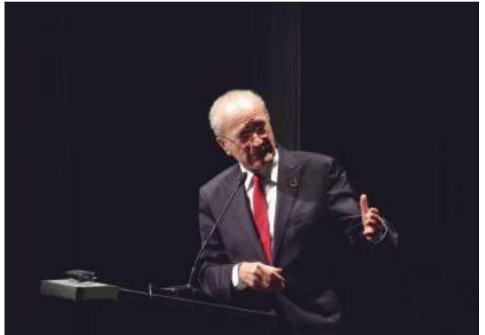
Intervención del alcalde de Málaga, Francisco de la Torre.