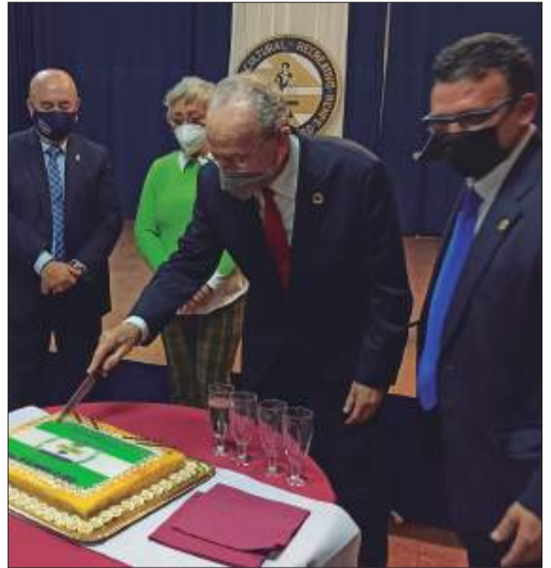
El alcalde fue el encargado de cortar la tarta del Aniversario.