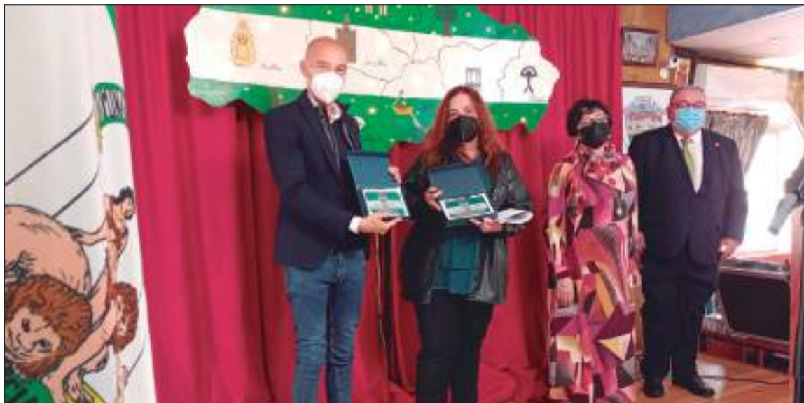
Entrega de recuerdos al presentador y a la pregonera del Día de Andalucía 2022 en esta entidad.