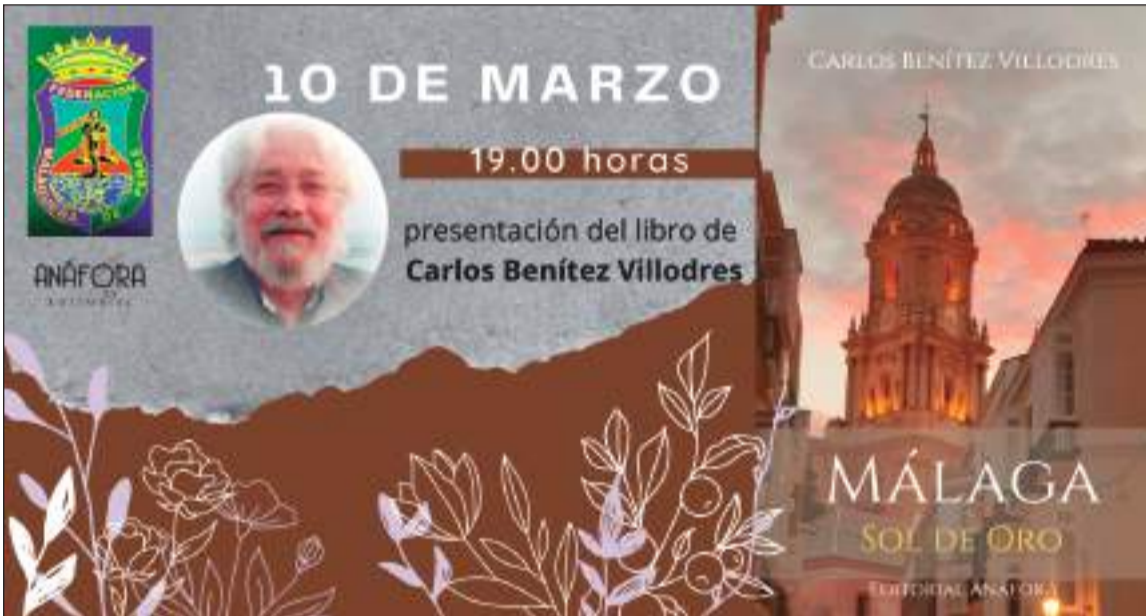
Acto de presentación del nuevo equipo deportivo de la asociación.

En la presentación, programada para las 19 horas, estará presente el editor y un representante de la familia del escritor.