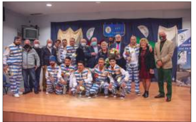
Murga de Los Leones, en la A.VV. Torrijos.