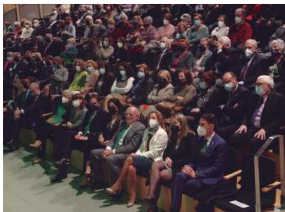
Autoridades, invitados y peñistas en el Auditorio Edgar Neville.