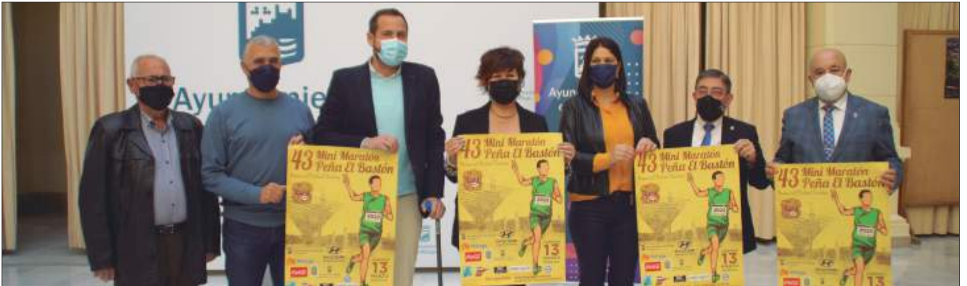
Acto de presentación de la prueba en el Ayuntamiento de Málaga.