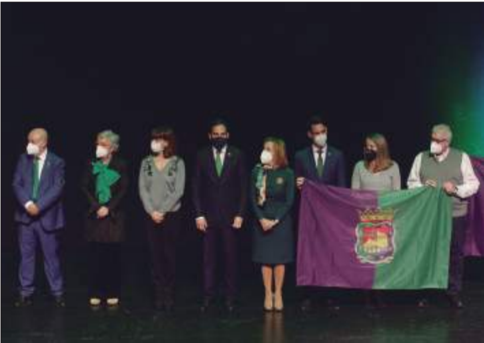
Representantes municipales que acompañaron al alcalde en la entrega de banderas.