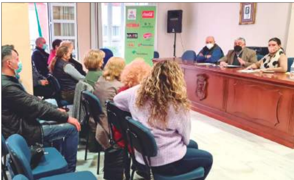
Acto de presentación de un nuevo curso de la Escuela de Cante y Copla 'Miguel de los Reyes'.

Aún está abierto el plazo de inscripción para nuevos alumnos, contactando con el correo electrónico secretariogeneral@femape.com o el teléfono 952 60 33 43.