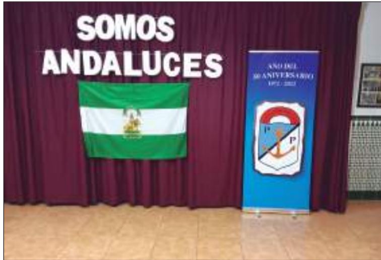
Decorado especial por el Día de Andalucía.

No fue menos festiva la celebración del Carnaval el pasado 5 de marzo, con la VI Degustación de Callos Percheleros y la actuación de agrupaciones de canto que amenizaron el evento.