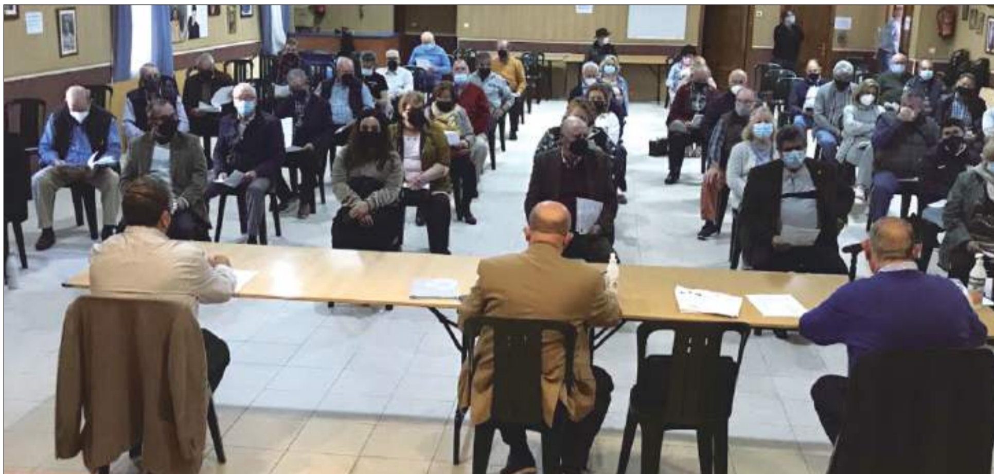
Asamblea celebrada el pasado año en la sede de la Casa de Álora Gibralfaro.

• FEDERACIÓN MALAGUEÑA DE PEÑAS, CENTROS CULTURALES Y CASAS REGIONALES 'LA ALCAZABA'