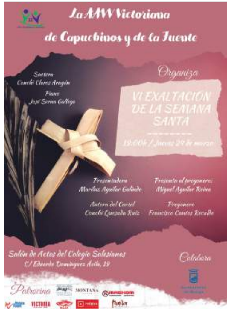
Cartel de la actividad.