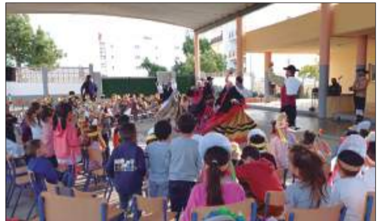
Exhibición en el Colegio San Miguel.

Se trata de una actividad multidisciplinar que incluía música, danza, bailes e indumentaria tradicional y de usanza para mostrar a los escolares esta parte fundamental de nuestra cultura.