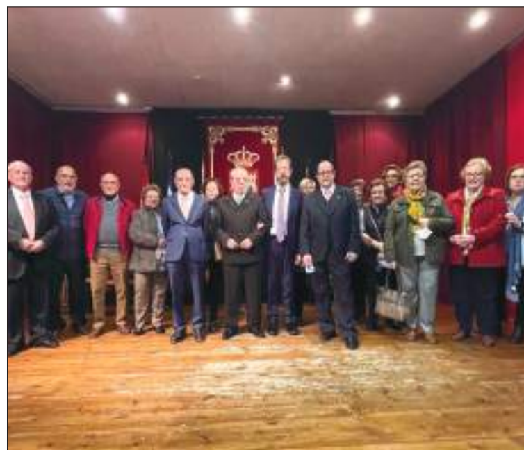
Celebración del Día de Andalucía.