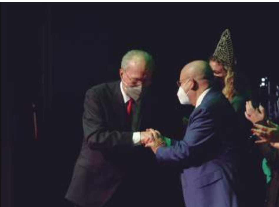
El presidente de la Federación muestra su agradecimiento al alcalde por su asistencia.