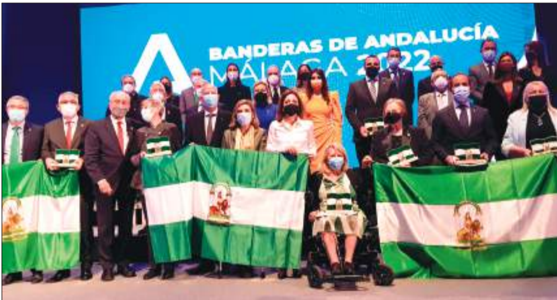
Acto de entrega de Banderas promovido por la Junta de Andalucía.