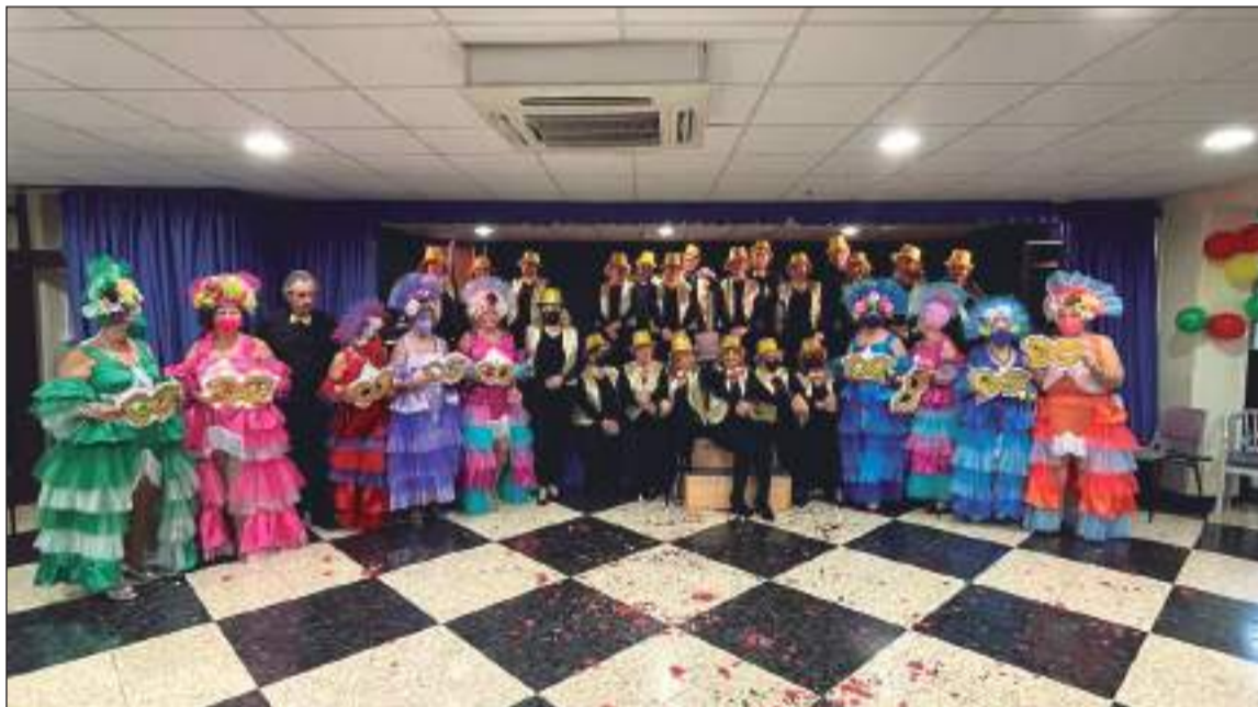
Disfraces de Carnaval en la sede de la Peña El Sombrero.