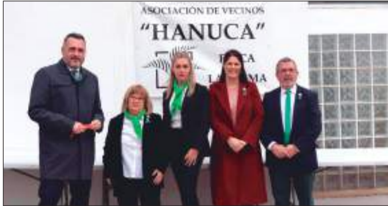
Representación del Distrito, con miembros de la asociación.

La Asociación de Vecinos Hanuca celebraba el pasado 26 de febrero el Día de Andalucía con un emotivo acto celebrado en el exterior de su sede, en la calle Sonata y en el que se contaba con la asistencia, entre otros, del alcalde Francisco de la Torre y la concejal delegada del Distrito, Noelia Losada.