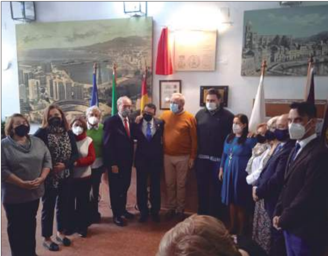
Una placa recuerda a Paqui Montes a la entrada de la sede del Centro Cultural Renfe