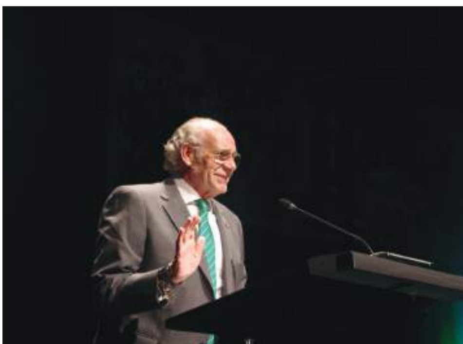
Coco Jurado, durante su Pregón del Día de Andalucía 2022.