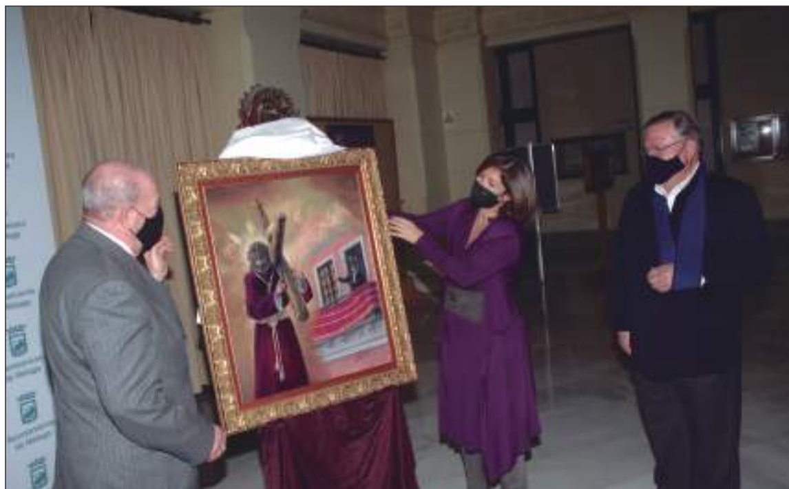
Presentación del Cartel del Concurso Nacional de Saetas 2022.