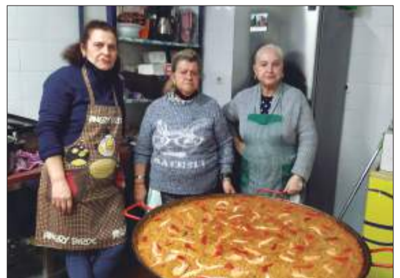
Preparativos de la paella que degustaron los socios.

Con estas actividades, desde esta entidad perteneciente a la Federación Malagueña de Peñas, Centros Culturales y Casas Regionales 'La Alcazaba' se pretende promover la unión entre todos sus integrantes.