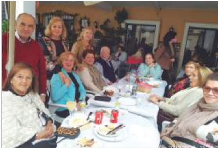
Ambiente durante el Día de Andalucía.