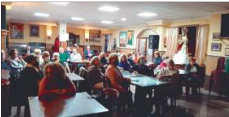
Público asistente a la conferencia en la Peña La Paz.