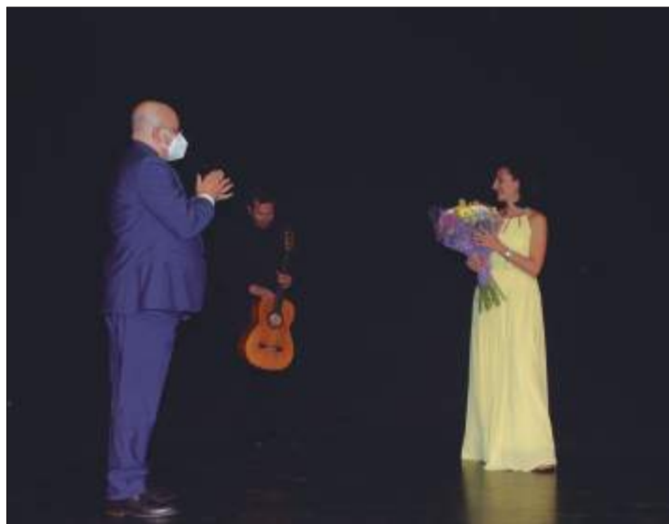
El presidente Manuel Curtido entrega un ramo de flores a La Morena.