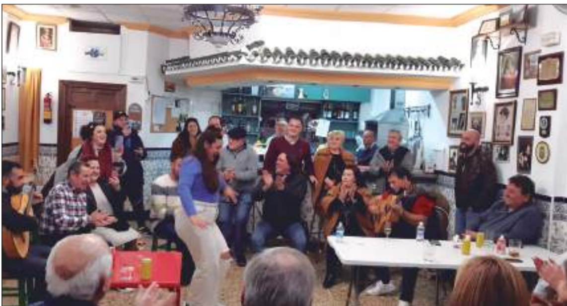
Un instante de la fiesta flamenca vivida en La Malagueña.