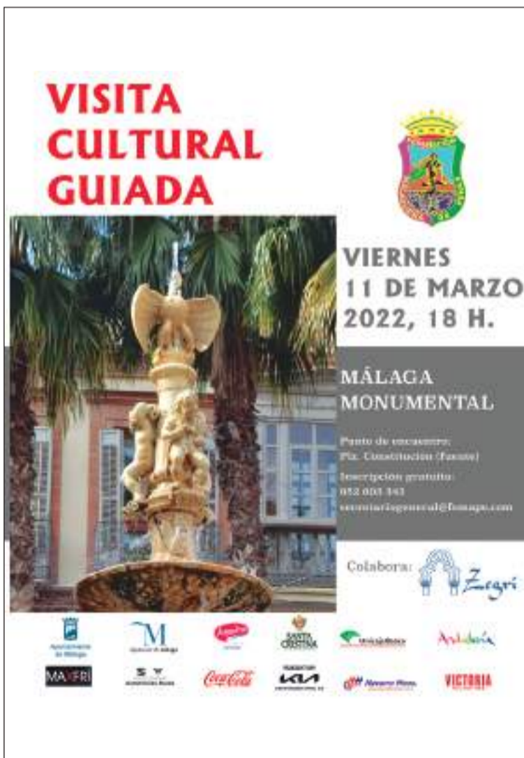
Cartel de la visita a la Málaga Monumental.