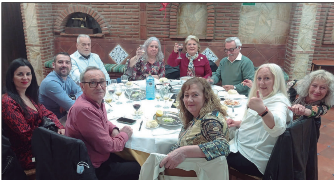
Grupo de socios en la Cena de San Valentín.

• ASOCIACIÓN FOLCLÓRICA CULTURA 'JUAN NAVARRO'