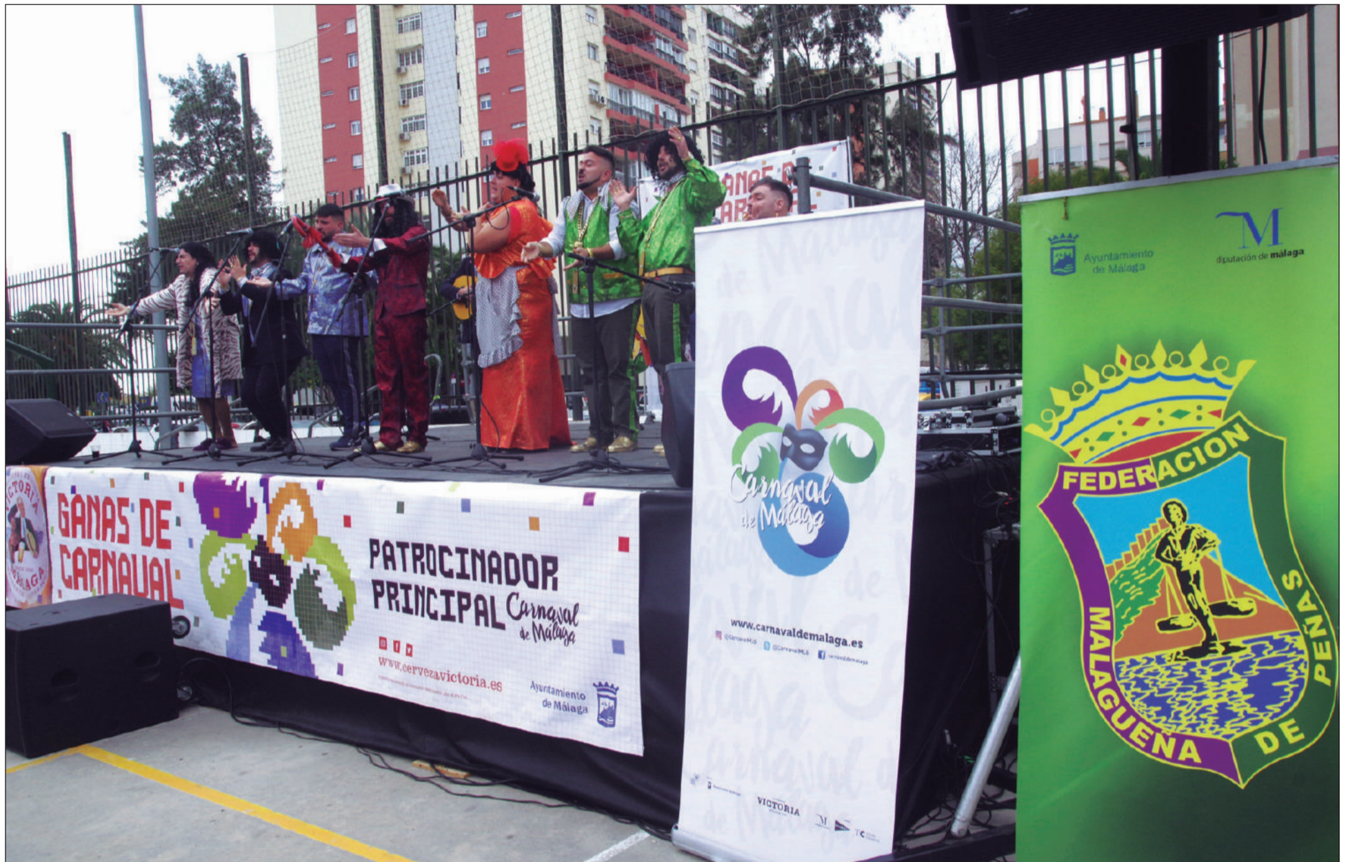
Una de las agrupaciones participantes en las Berzas Carnavales celebradas en el Distrito Cruz de Humilladero.

• FEDERACIÓN MALAGUEÑA DE PEÑAS, CENTROS CULTURALES Y CASAS REGIONALES 'LA ALCAZABA'