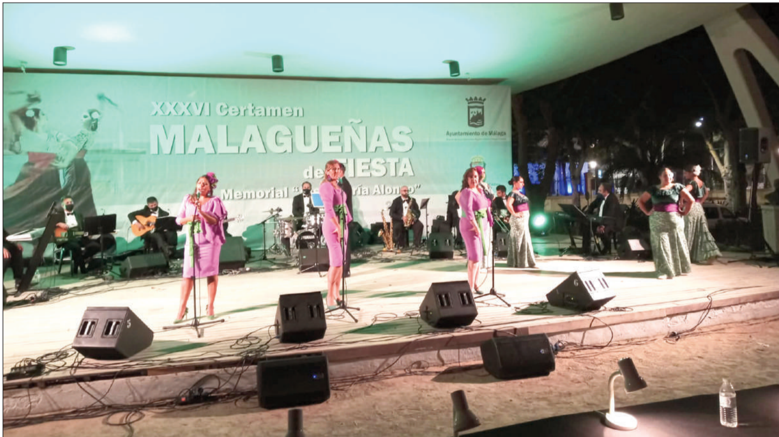
Imagen de la final del Certamen de Malagueñas celebrado el pasado año en el Auditorio Eduardo Ocón.

Igualmente, se configura el baile como parte esencial del Certamen, por lo que atañe a la difusión que se persigue.