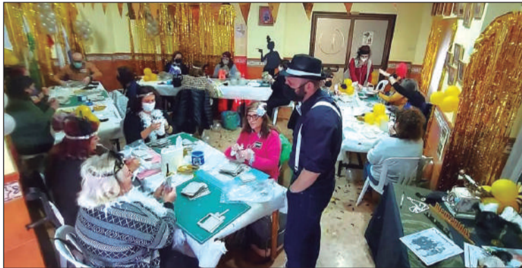
Un instante del taller.

Los asistentes disfrutaron de un día completo de trabajo, con parada para comer, para realizar un teléfono tematicado en los años 1920.