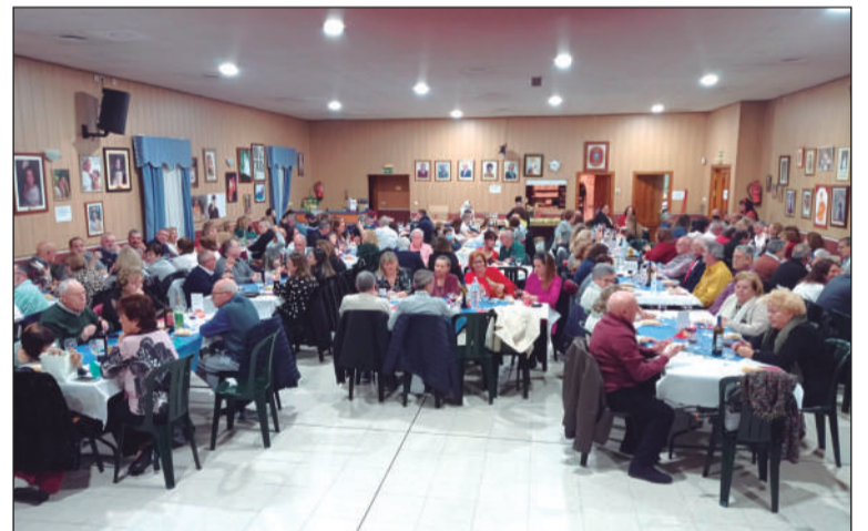
Día de San Valentín.