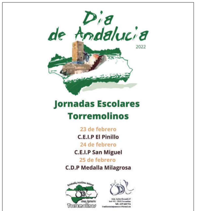
Cartel de esta actividad.

«Para amar algo hay que conocerlo, conozcamos nuestras raíces», señalan desde esta entidad perteneciente a la Federación Malagueña de Peñas, Centros Culturales y Casas Regionales 'La Alcazaba'.