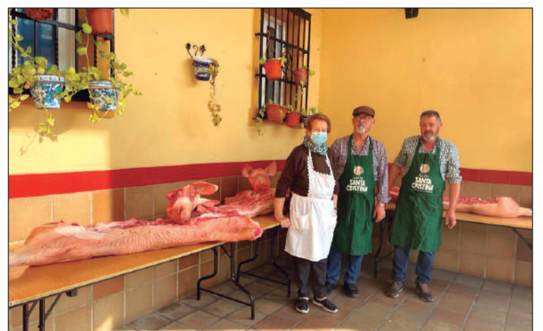
Día del Guarro.