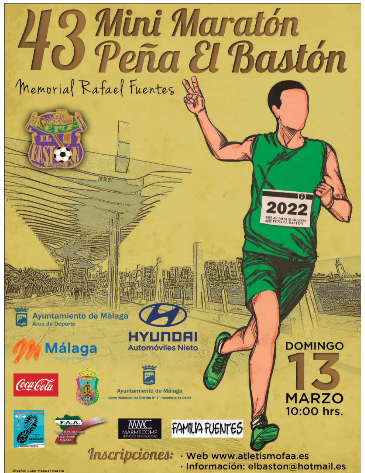
Cartel de la 43 Mini-Maratón de la Peña El Bastón.