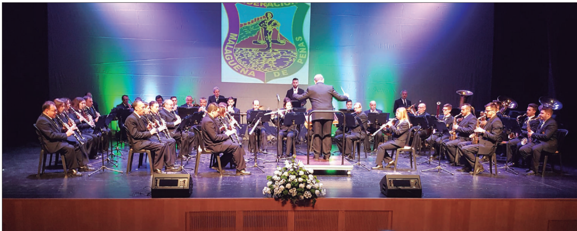
Intervención de la Banda Municipal de Málaga en el Día de Andalucía 2020.

• FEDERACIÓN MALAGUEÑA DE PEÑAS, CENTROS CULTURALES Y CASAS REGIONALES 'LA ALCAZABA'