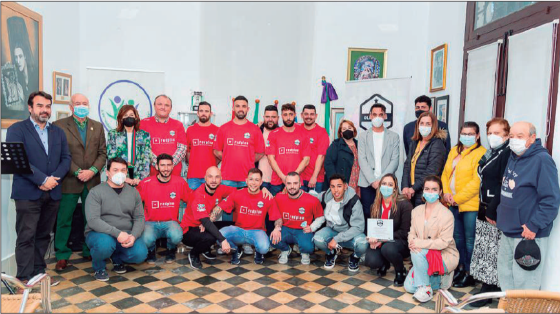
Acto de presentación del nuevo equipo deportivo de la asociación.