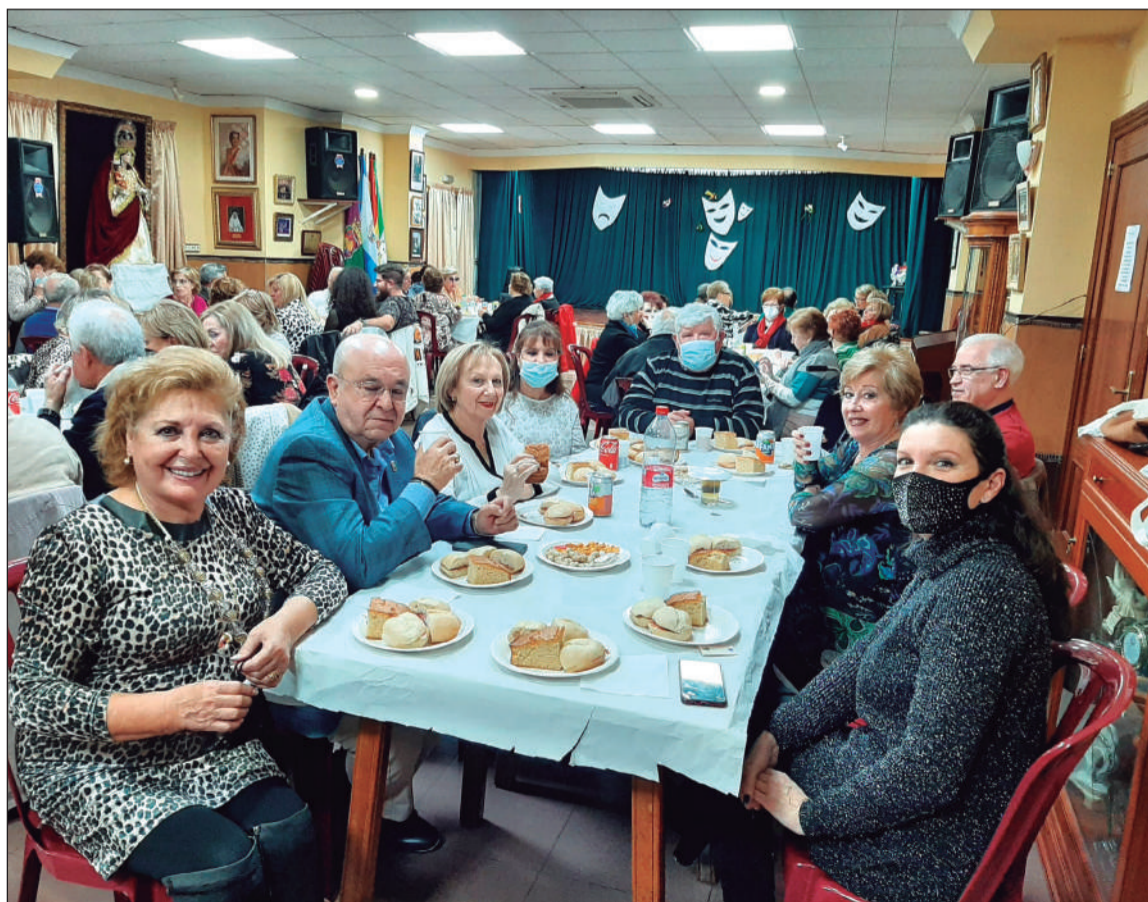
Merienda de Carnaval celebrada el pasado fin de semana en la sede de la Peña La Paz.