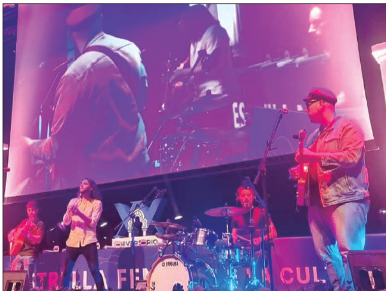
El acto de entrega de estos premios contaba con música en directo.

Entre sus componentes se encuentran conocedores de la historia y el patrimonio de Málaga, así como por amantes de la cultura.