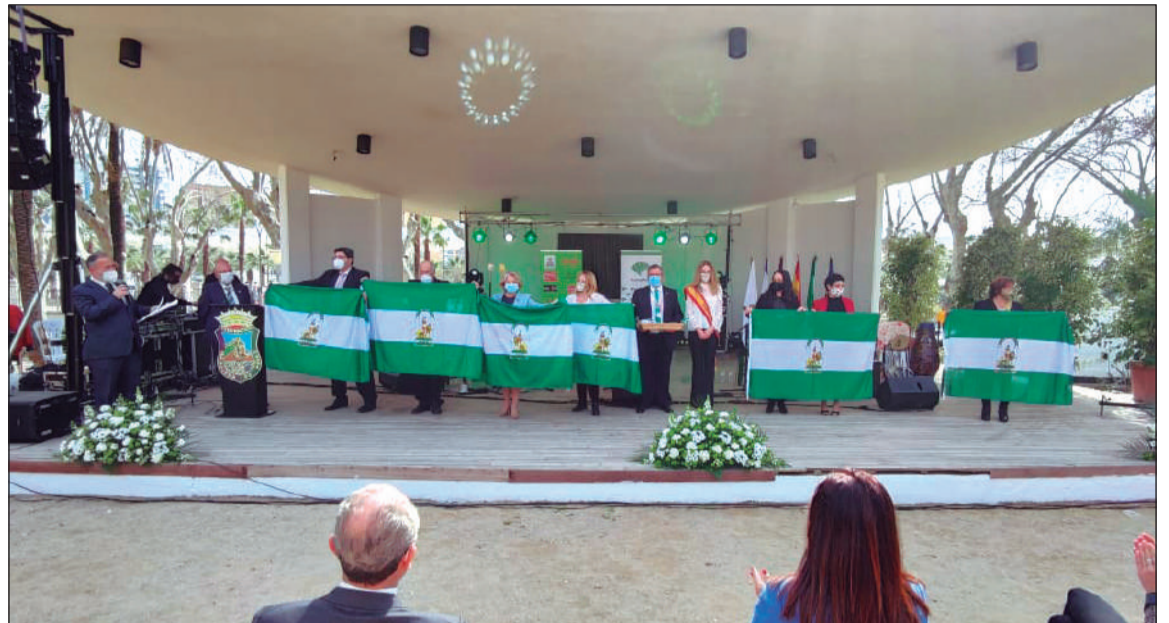
Entrega de banderas en el Día de Andalucía 2021, en el que no hubo representación de la Junta de Andalucía.

No obstante, confiamos plenamente que nuestras autoridades autonómicas serán receptivas a las que consideramos son unas legítimas demandas por parte de un colectivo tan importante como es el de las peñas de Málaga. Sin nosotros, no les quepa duda, buena parte de esa Andalucía tradicional estaría olvidada.