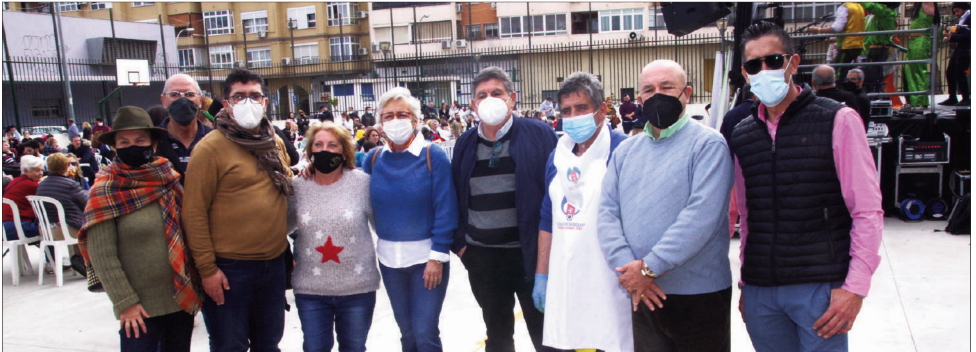
La BerzaCarnalera contó con una gran participación en las pistas deportivas de la calle Benjamin Franklin.

ración de dos entidades federadas como son la Peña Santa Cristina y la Peña Tiro Pichón; así como de la propia Federación.