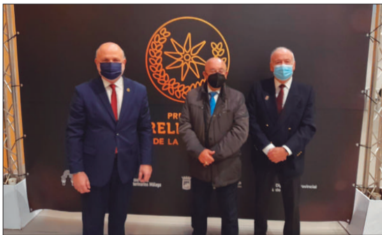
Representación peñista en este acto.