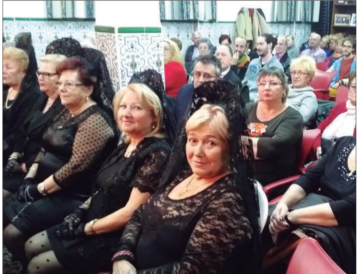
Es tradicional que las socias de las entidades luzcan las mantillas en los actos cuaresmales.

Igualmente, la Federación Malagueña de Peñas se encuentra abierta a la colaboración, dentro de sus posibilidades, para cualquier otra necesidad que puedan contar las entidades para el desarrollo de estos tradicionales actos, como por ejemplo pueden ser saeteros.