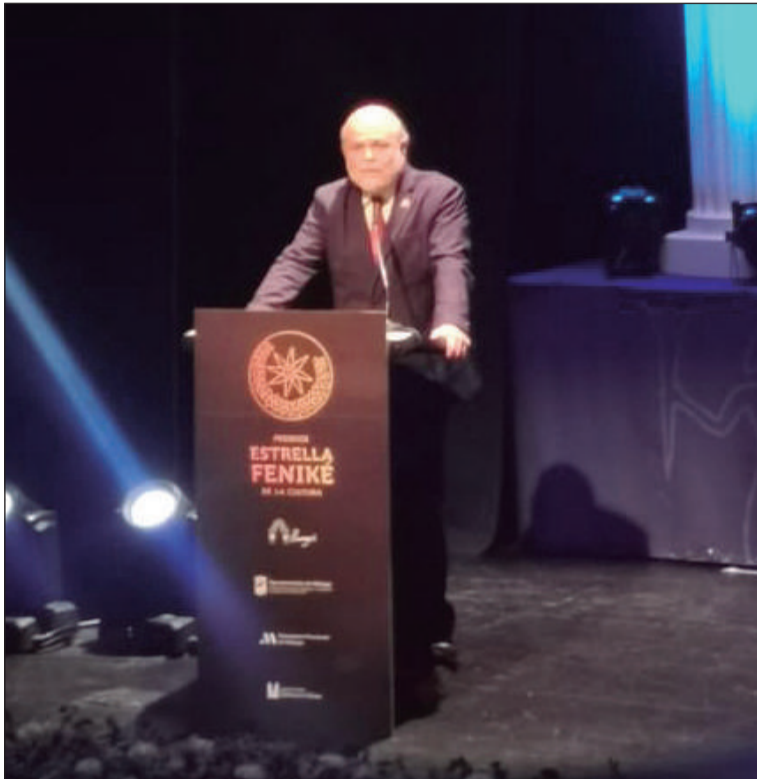
Intervención del presidente de Zegrí.