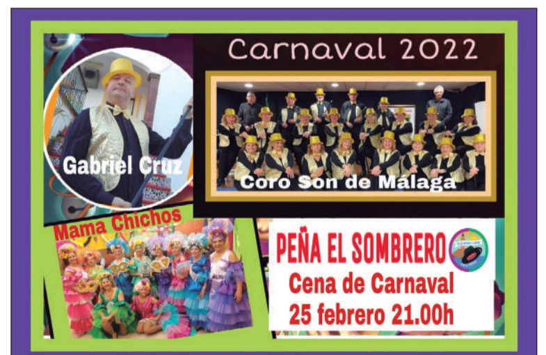
Cena de Carnaval del próximo viernes.