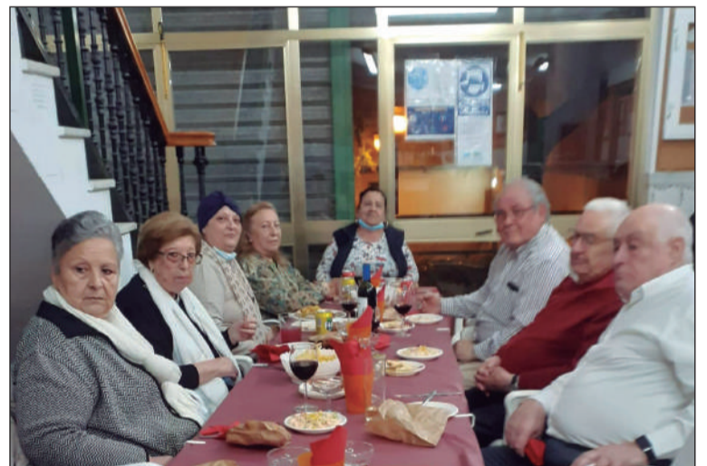
Socios disfrutan del Día de los Enamorados.

Todos los socios disfrutaron de un menú preparado para la ocasión, y disfrutaron de una agradable jornada de confraternidad en torno a la festividad de San Valentín.