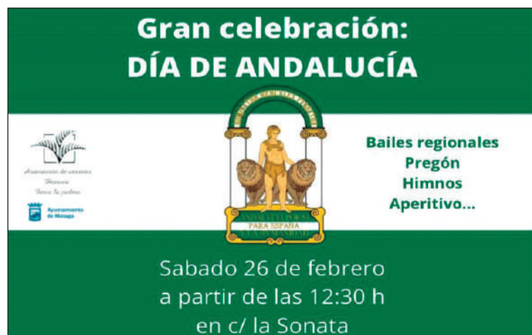
Cartel de la actividad.

26 de febrero con un acto que tendrá lugar desde las 12:30 horas en la calle Sonata, en un acto que contará con bailes regionales, pregón, himnos y aperitivos.