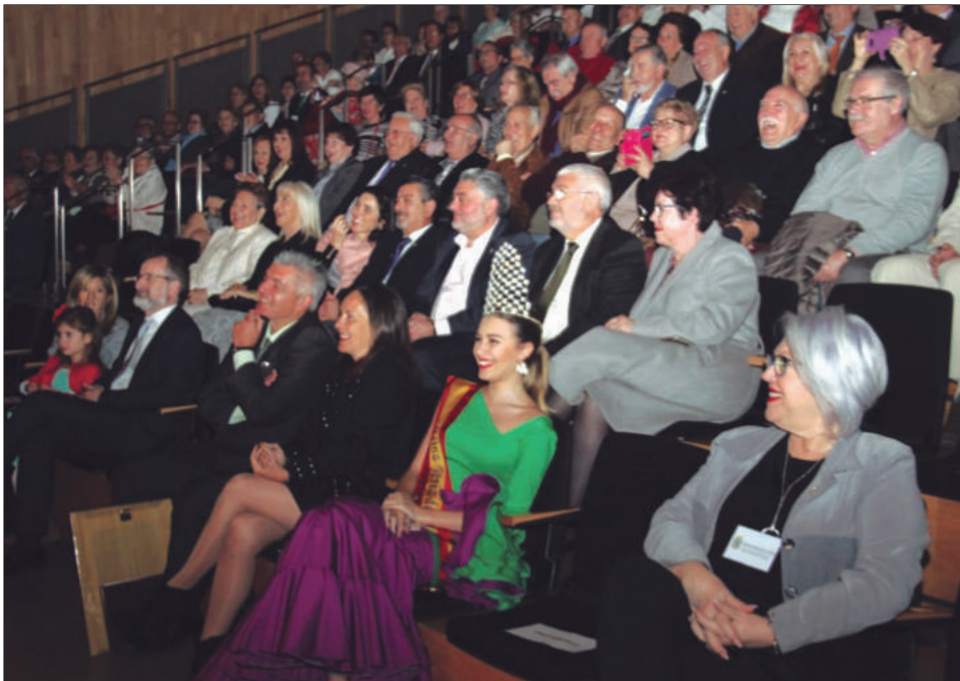
Aspecto del Auditorio Edgar Neville durante su edición de 2019. Este año se volverá a llenar el recinto de la Diputación, con uno obligado de la mascarilla.

• FEDERACIÓN MALAGUEÑA DE PEÑAS, CENTROS CULTURALES Y CASAS REGIONALES 'LA ALCAZABA'