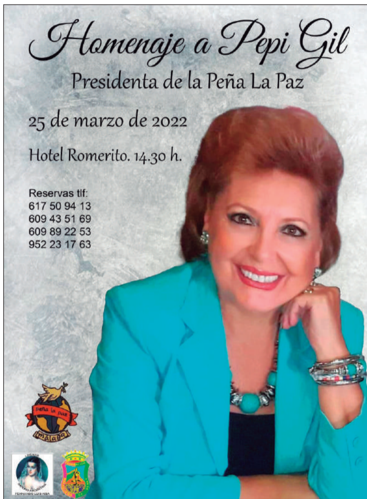
Cartel del Homenaje.

Se pueden realizar las reservas en los teléfonos incluidos en el cartel: 617 50 94 13, 609 43 51 69, 609 89 22 53 y 952 23 17 63.