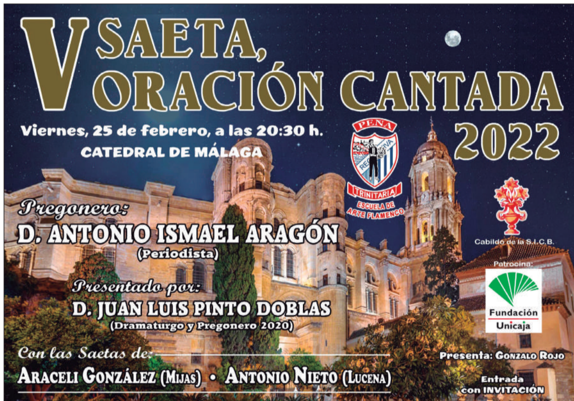
Cartel del acto del próximo viernes 25 en la Catedral.

esta entidad perteneciente a la Federación Malagueña de Peñas, Centros Culturales junto al Concurso Nacional de Saetas y Pasión en la Trinidad, un evento programado como homenaje al barrio de la Trinidad y sus Cofradías con pregones, baile, música y proyecciones; que tendrá lugar el 26 de marzo en el Auditorio Edgar Neville de la Diputación de Málaga.