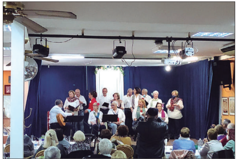
Actuación del coro del Centro Cultural Renfe.

En el transcurso del acto se contaba con la actuación del Coro 'Aires de Renfe', compuesto por socios de esta entidad federada.