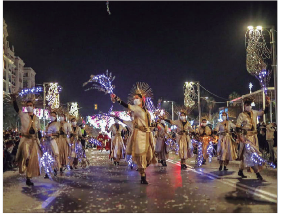
Uno de los pasacalles que formaban parte de la cabalgata.