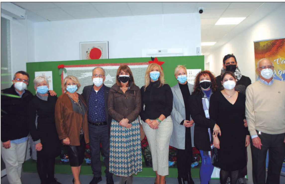
Voluntarios de Grupo Girasoles en la inauguración del Rastrillo Benéfico.