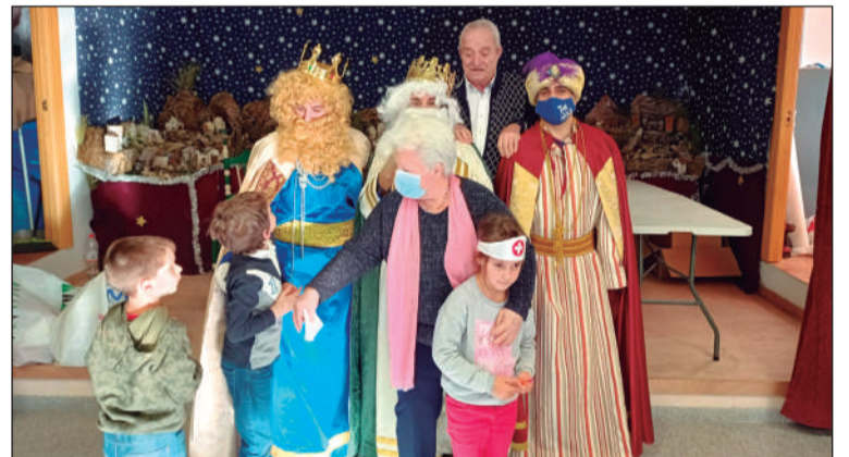
Pequeños y mayores disfrutaron de la presencia de los Reyes Magos.

Lógicamente, fueron los niños los que más disfrutaron de la presencia de Melchor, Gaspar y Baltasar, en una jornada inolvidable para todos ellos.