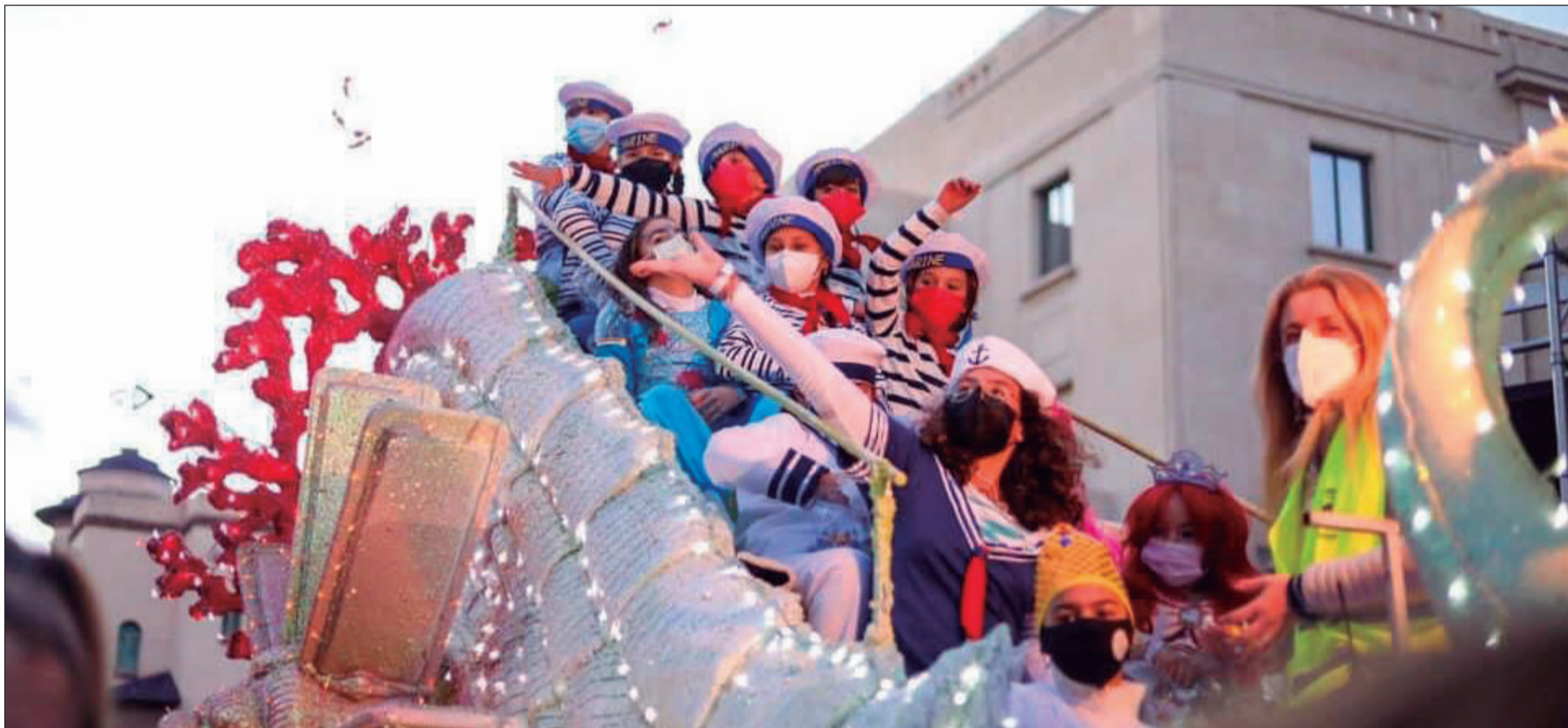
Niños lanzando caramelos en el inicio de la Cabalgata.

• FEDERACIÓN MALAGUEÑA DE PEÑAS, CENTROS CULTURALES Y CASAS REGIONALES 'LA ALCAZABA'