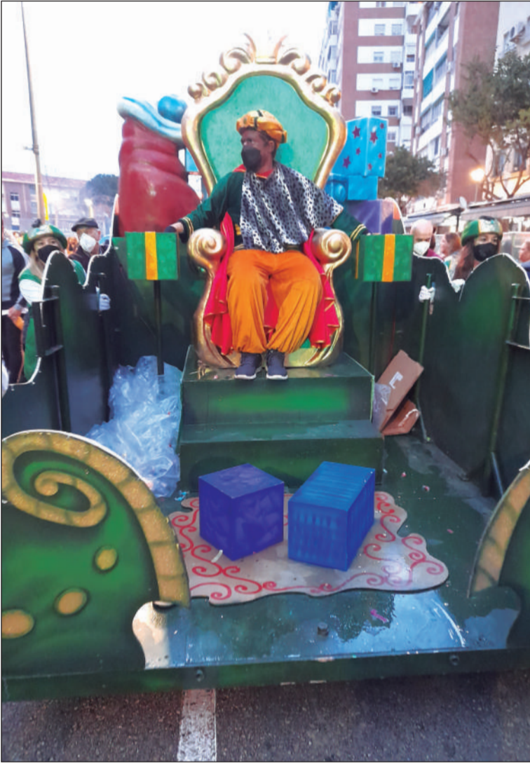
La Peña Los Rosales, un año más acompañó al Rey Baltasar en Miraflores.