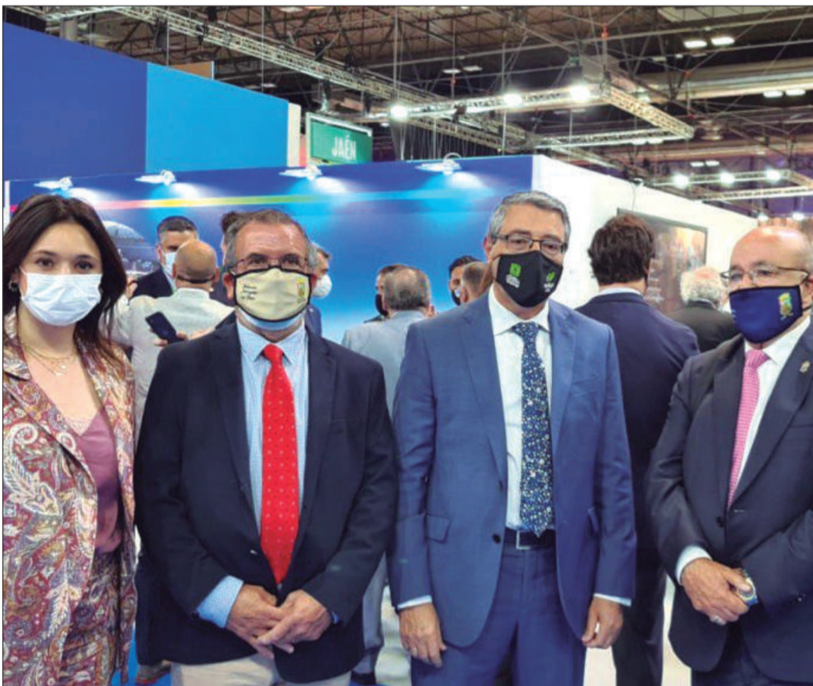
Presencia de la Federación de Peñas en la edición de 2021 de FITUR.

De forma especial, la Federación Malagueña de Peñas quiere mostrar el potencial de uno de sus nuevos eventos, como es la Pasarela FEMAPE Flamenca que, junto a la Diputación de Málaga, celebraba el pasado 2021 su primera edición.