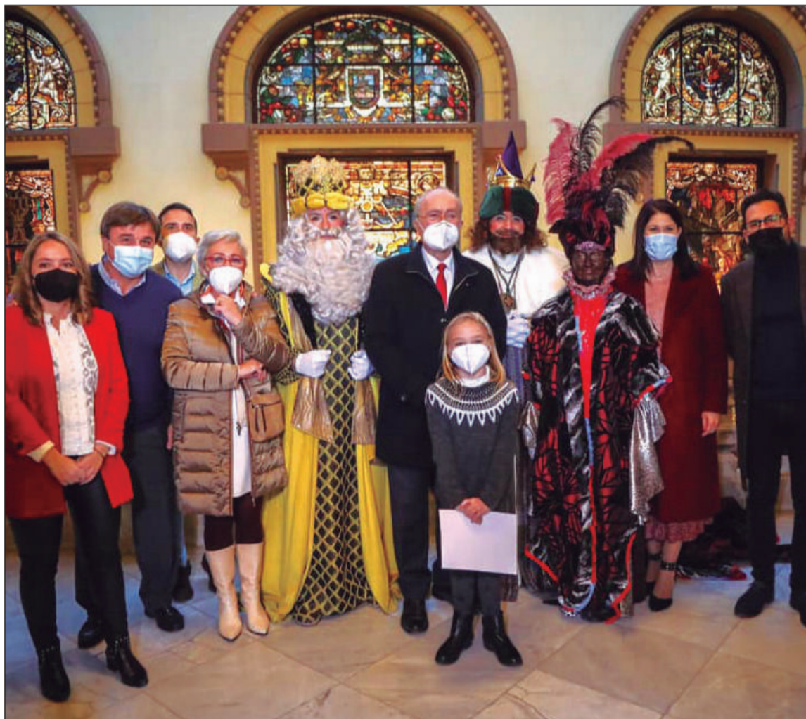
Recepción del Alcalde y miembros de la Corporación a los Magos de Oriente.