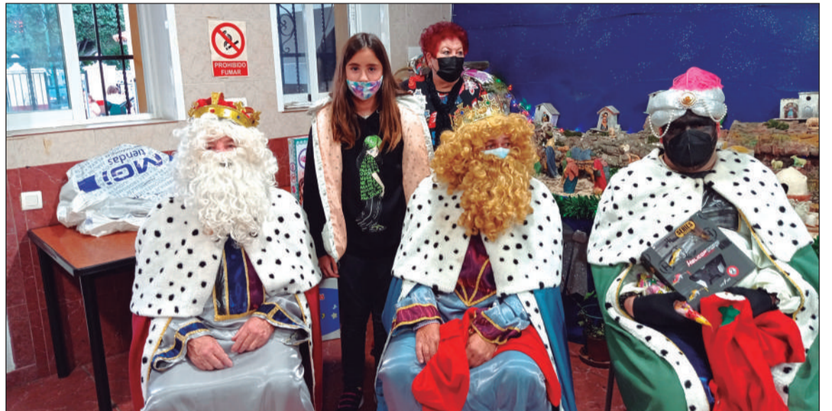
Melchor, Gaspar y Baltasar, en la sede de la Casa de Álora.

Ya en el interior de la sede, los pequeños tuvieron la oportunidad de agradecer a los Magos de oriente todos los regalos dejados la noche anterior.