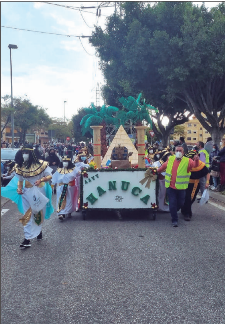
La Asociación de Vecinos Hanuca contó con su carroza en Teatinos.