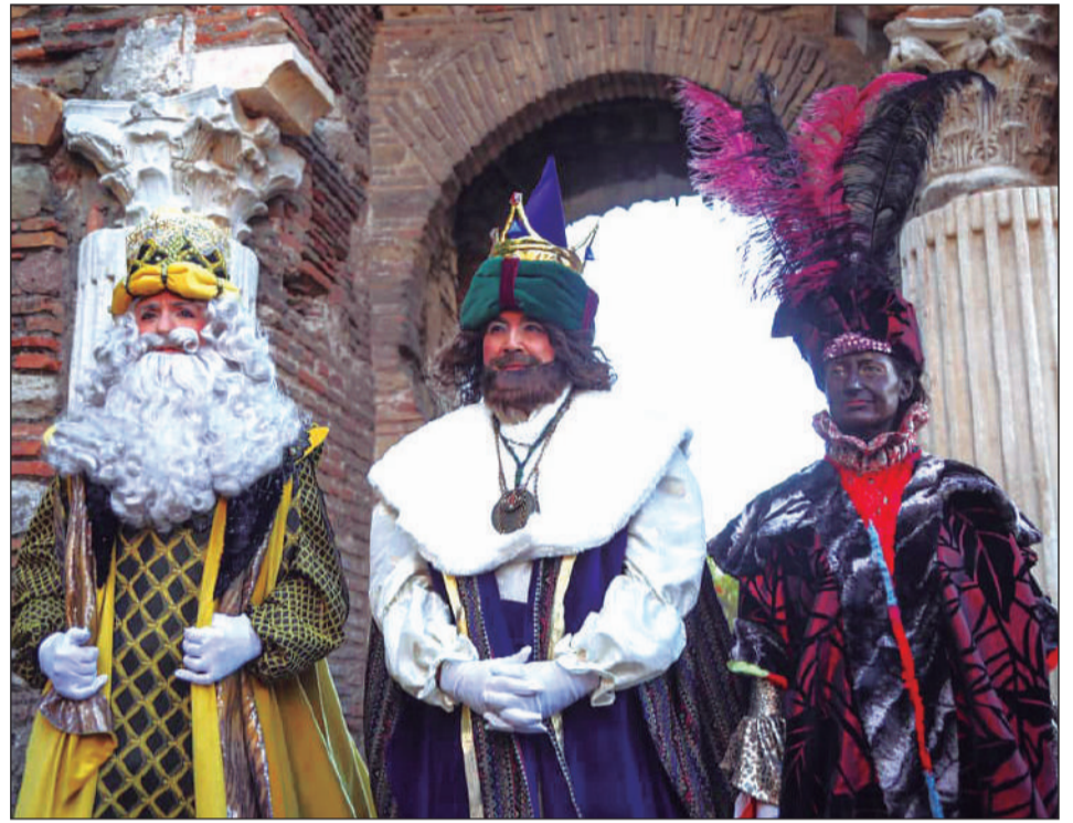
Los Magos de Oriente, a su salida de la Alcazaba, donde durmieron el día 4 de enero.