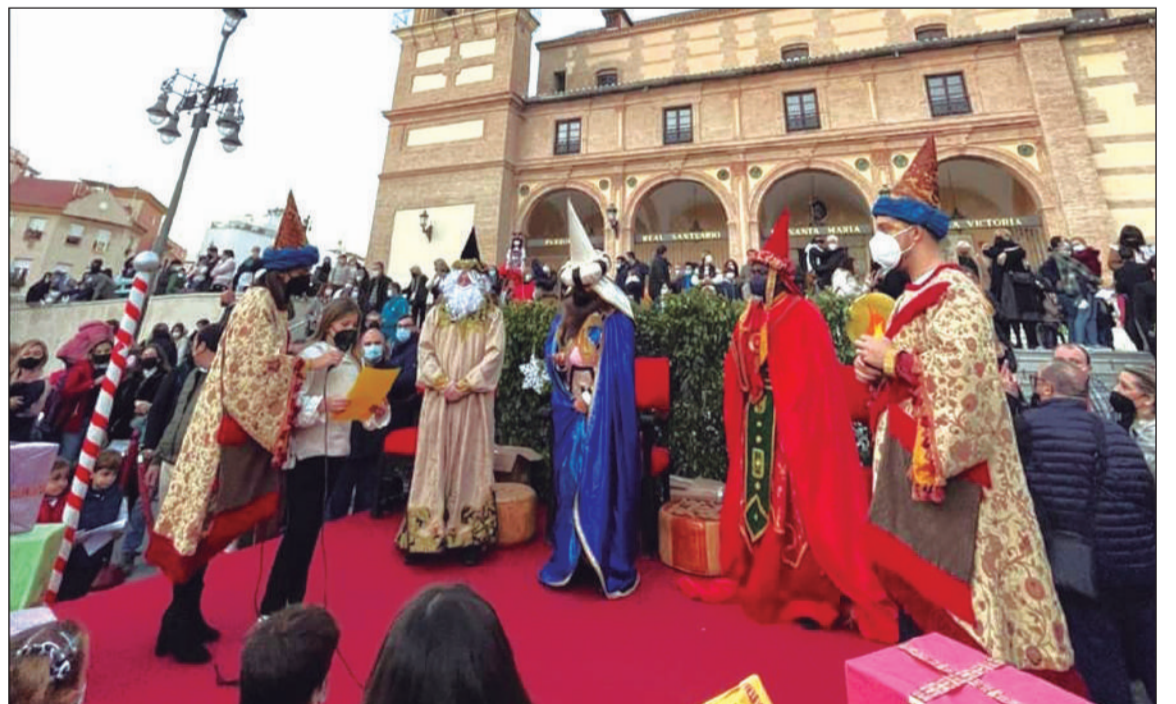
Encuentro de los Magos de Oriente en la Victoria con representantes de colectivos y cofradías del barrio.