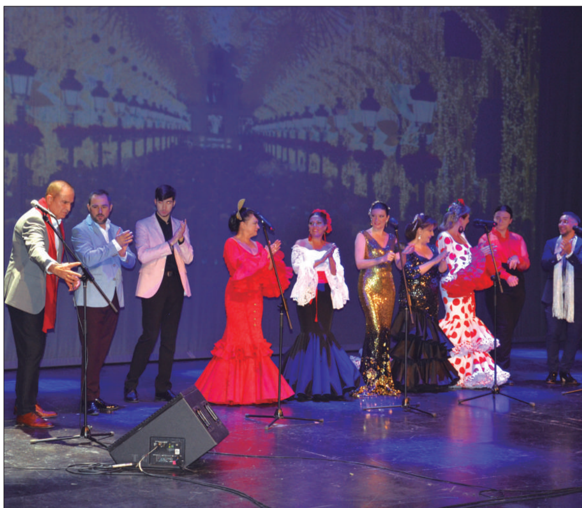
Algunos de los artistas participantes en este espectáculo de Málaga Cantaora.