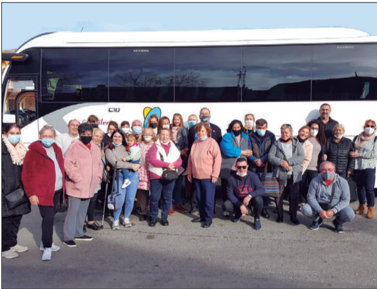
Socios participantes en esta actividad.

De este modo, los socios de la entidad podían conocer de primera mano su Museo de Chocolate; compartiendo el desayuno y un almuerzo servido en la cercana localidad de Benamejí.