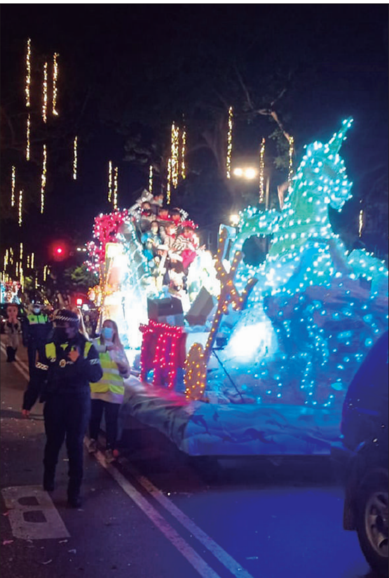
Carroza iluminada durante el recorrido de la cabalgata.