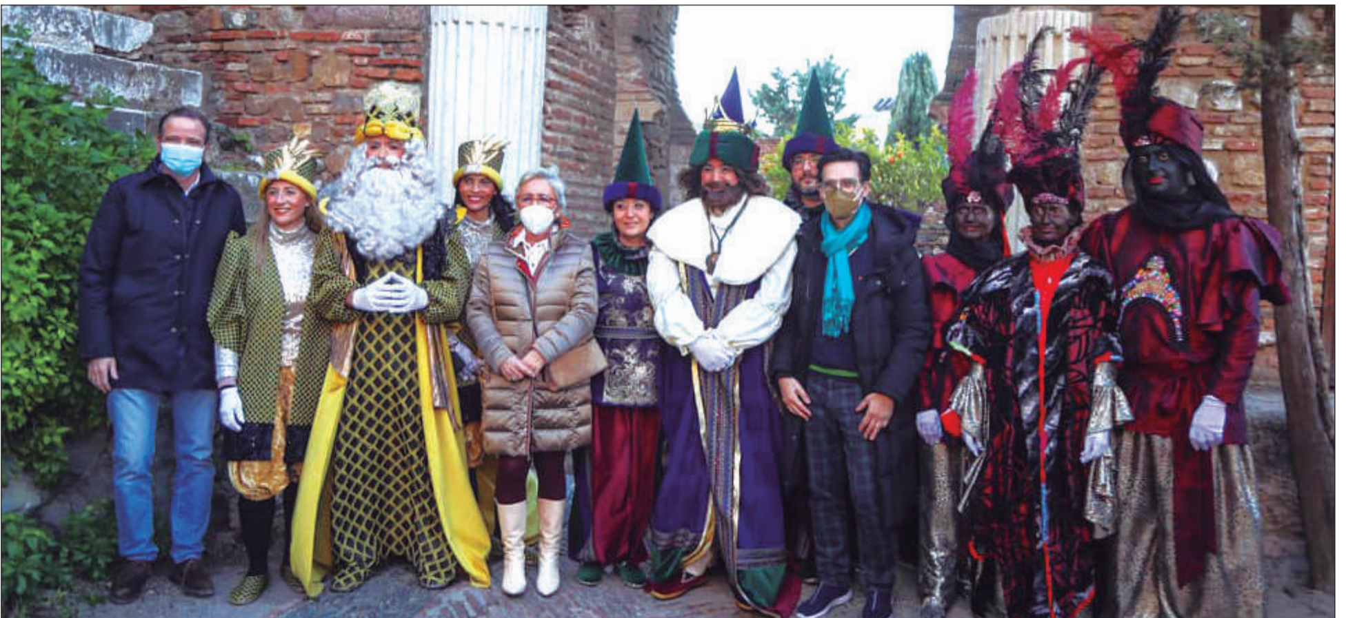
Recepción a los Reyes en la Alcazaba, para iniciar su cortejo a pie hasta el Ayuntamiento.