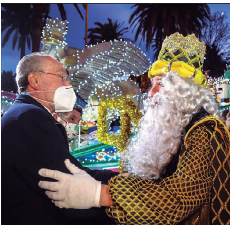
El Alcalde acompañó a los Reyes a sus carrozas.