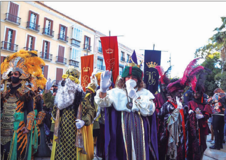
Sus Majestades se desplazaron a pie desde la Alcazaba al Ayuntamiento.