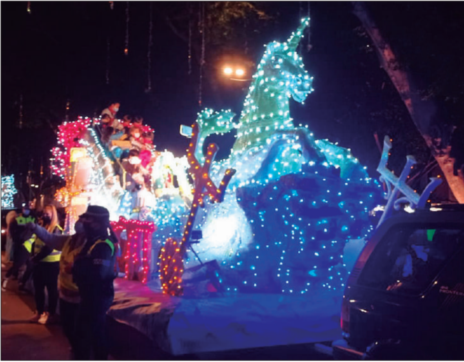
La carroza de Delfines de la Federación de Peñas fue la primera del cortejo.