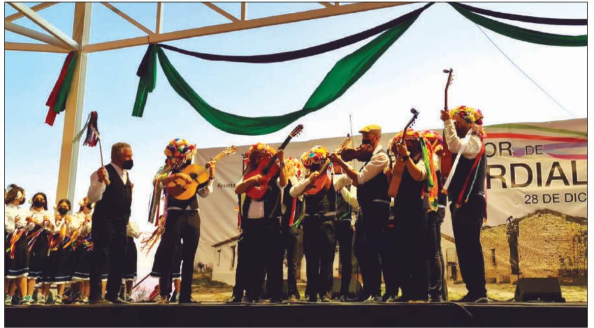
Una de las pandas participantes en una Fiesta Mayor de Verdiales que se prolongó durante todo el día 28.