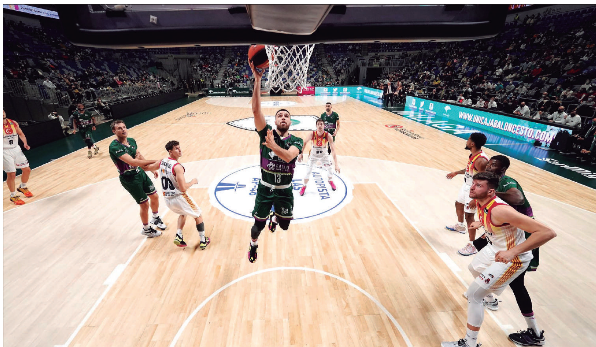
Una imagen de la espectacular victoria de Unicaja ante Casademont Zaragoza que pudieron presenciar los peñistas.