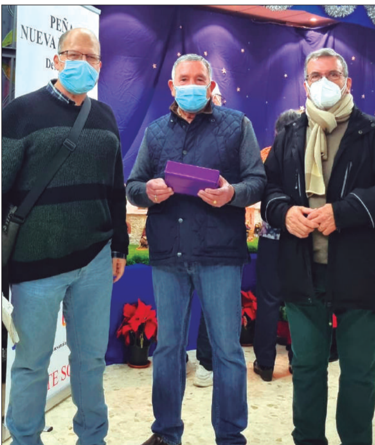
Entrega de regalos entre los socios de la entidad.