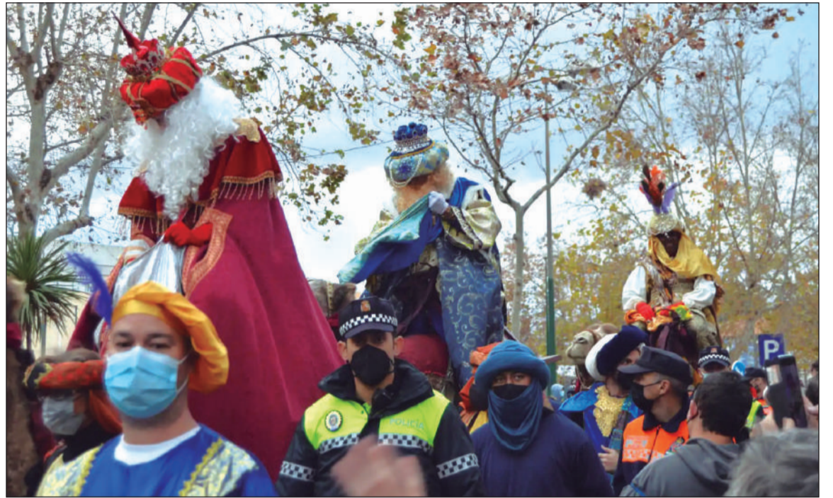
Los Reyes Magos llegaron el 4 de enero al Distrito Cruz de Humilladero en camellos y acompañados por entidades.