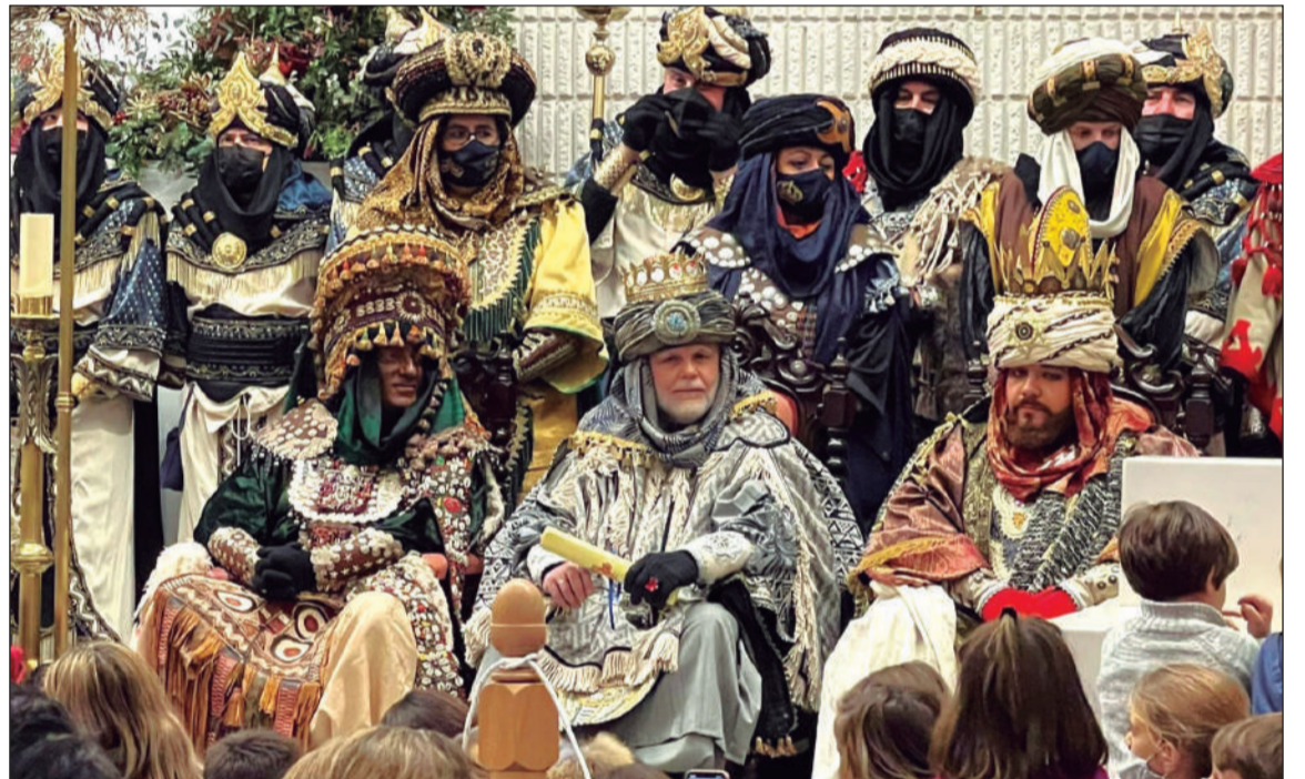
Los Reyes Magos, en su recepción en el Distrito Málaga - Este.