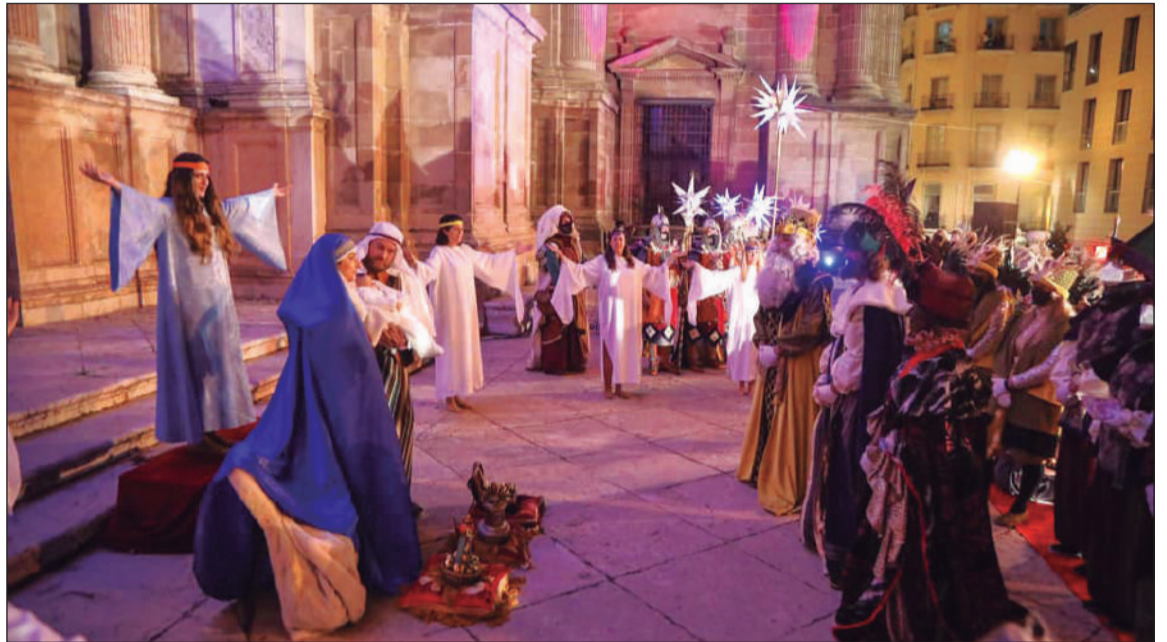
Los Reyes Magos adoran al Niño en el Belén Viviente de la Catedral.

En el recorrido de vuelta al pasar la Plaza de La Marina, Sus Majestades los Reyes y su cortejo bajaban de sus carrozas y se dirigían a pie hacia la Catedral. En la escalinata principal Melchor, Gaspar y Baltasar realizaron la ofrenda ante un Nacimiento viviente representado por Eventos con Historia mientras sonaban las voces de la Escolanía del Orfeón Universitario de Málaga.