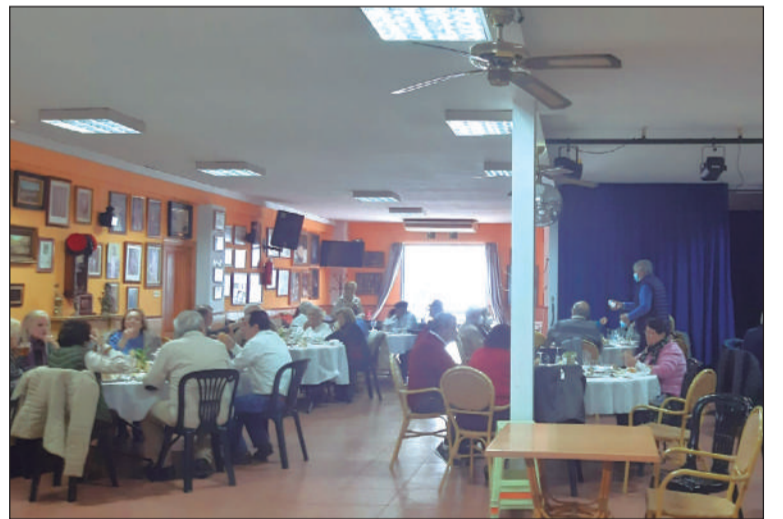
Vista general del salón durante la actividad.