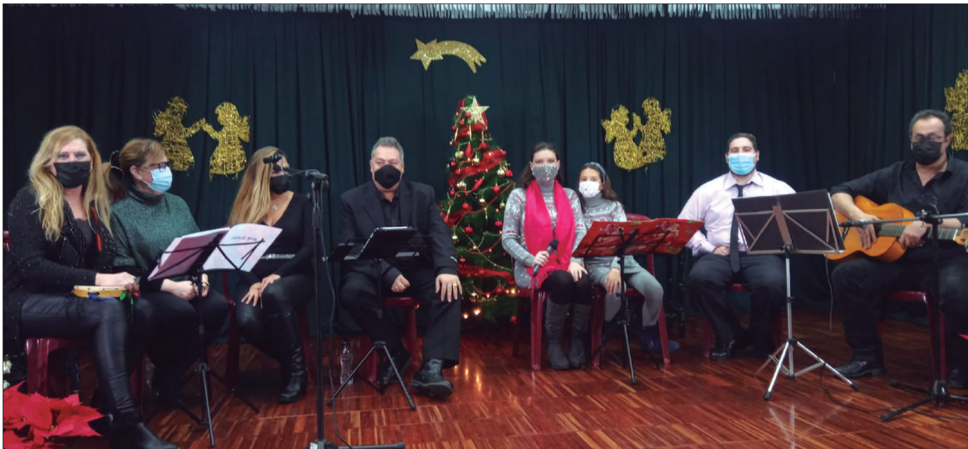
Un instante del espectáculo ofrecido el pasado 26 de diciembre por la Federación Malagueña de Peñas en la sede de la Peña La Paz.

• FEDERACIÓN MALAGUEÑA DE PEÑAS, CENTROS CULTURALES Y CASAS REGIONALES 'LA ALCAZABA'