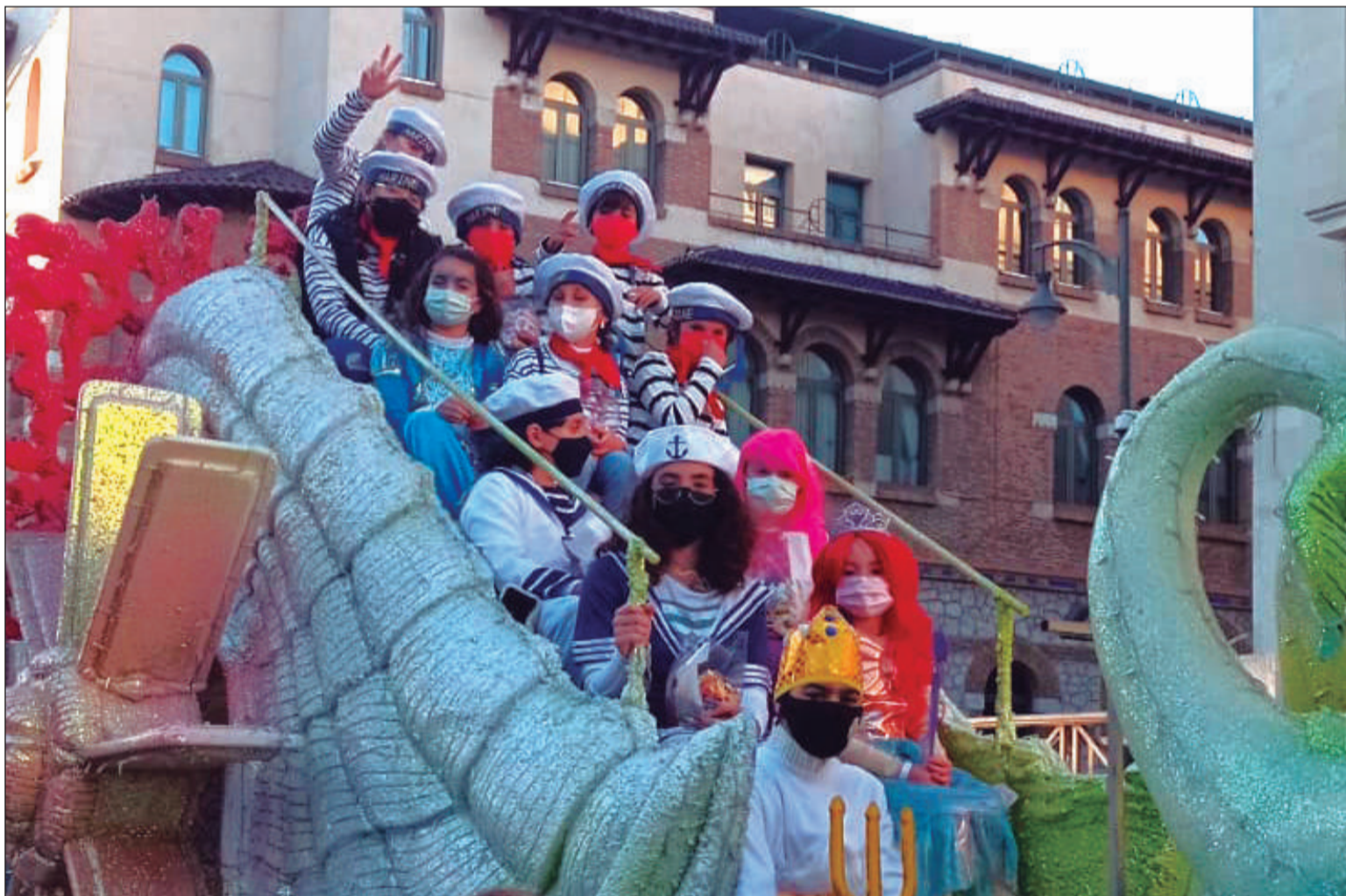
Ilusión de los niños de la carroza de la Federación instantes antes de comenzar el desfile.

En este sentido, desde la Junta Directiva de la Federación Malagueña de Peñas se quiso abrir la oportunidad a que cualquier niño de una entidad federada pudiera formar parte de la carroza; poniendo a disposición de las mismas las trece plazas que tenía como aforo.