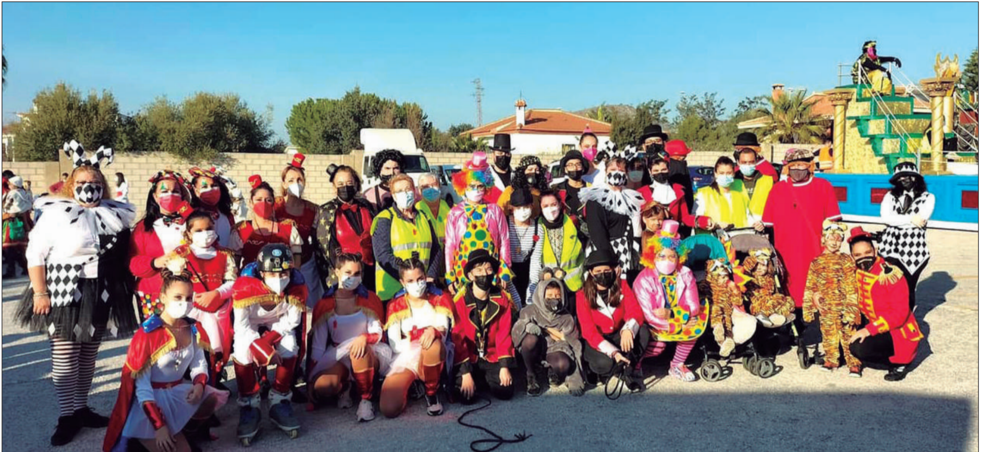
Los socios de la Peña Finca La Palma crearon un gran pasacalles circunense en la cabalgata del Distrito Teatinos-Universidad.

• FEDERACIÓN MALAGUEÑA DE PEÑAS, CENTROS CULTURALES Y CASAS REGIONALES 'LA ALCAZABA'