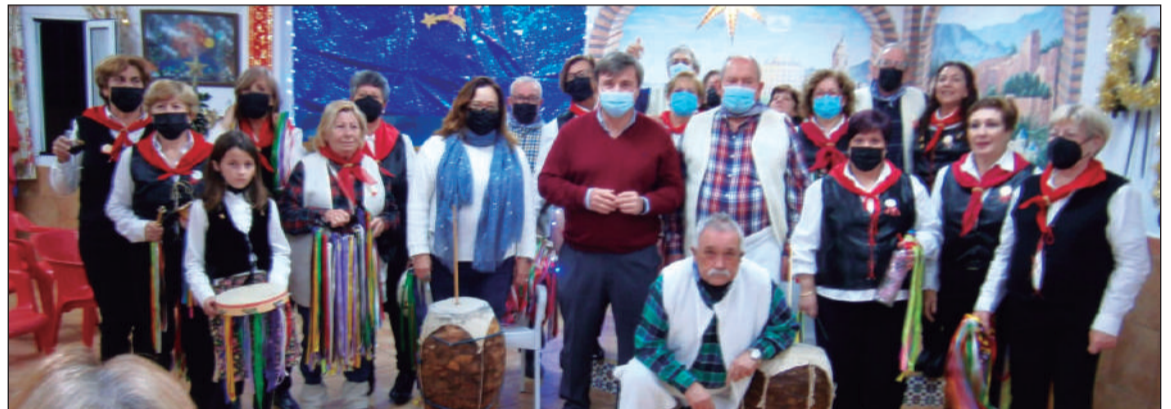
La Pastoral de la Peña Montesol Las Barrancas.