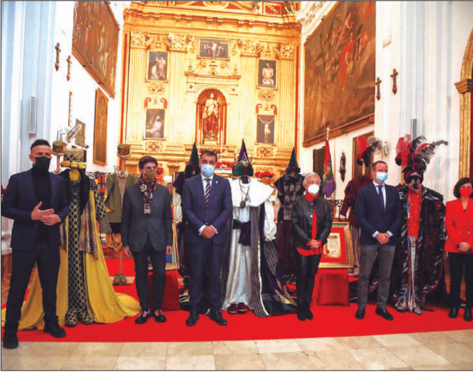
Presentación de los trajes reales, diseñados por Jesús Segarra.