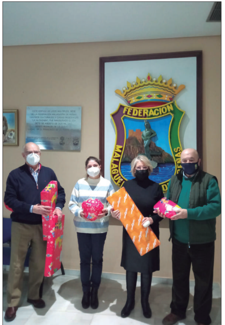
Entrega de juguetes en la sede de la Federación Malagueña de Peñas.

Esta Navidad promovían una Campaña de Recogida de Juguetes que han sido donados a diferentes colectivos. Para ellos, hicieron partícipes a todas las entidades federadas