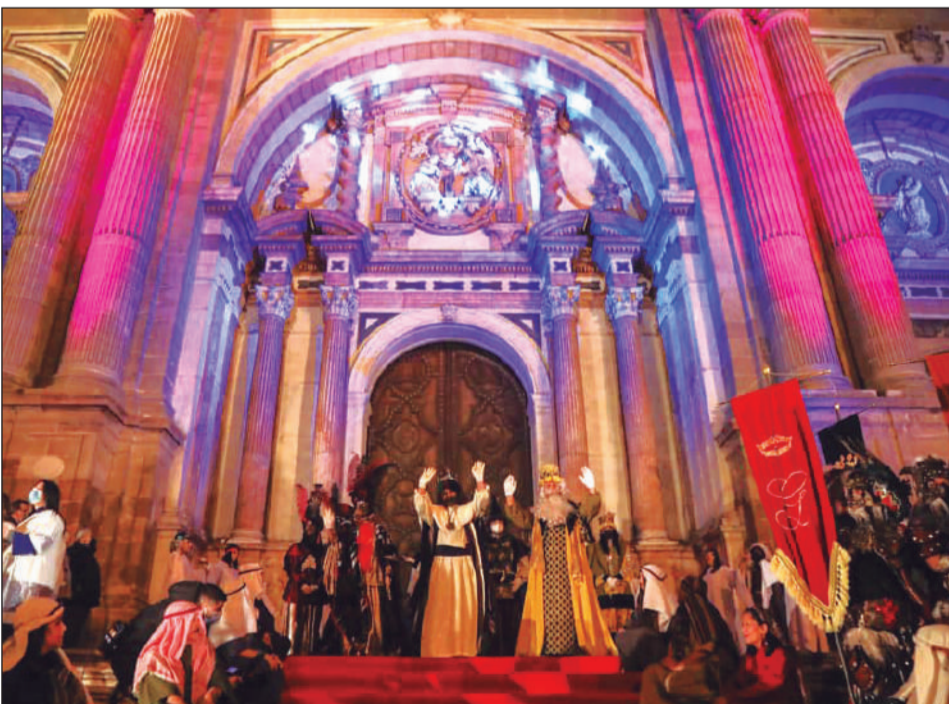
Llegada de los Reyes Magos a la Catedral, donde se encontraba un Belén Viviente.