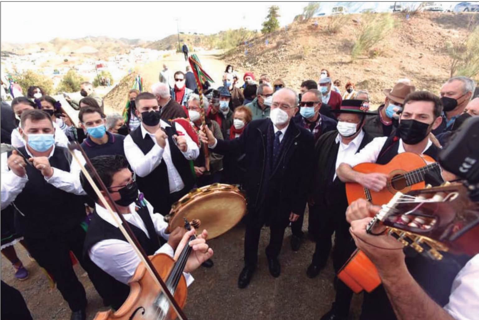
El alcalde, al frente de una de las pandas.

Este encuentro se realizaba con las medidas de seguridad sanitaria adaptada a la situación actual de la pandemia. De hecho en las bases se establecía que todos los verdialeros