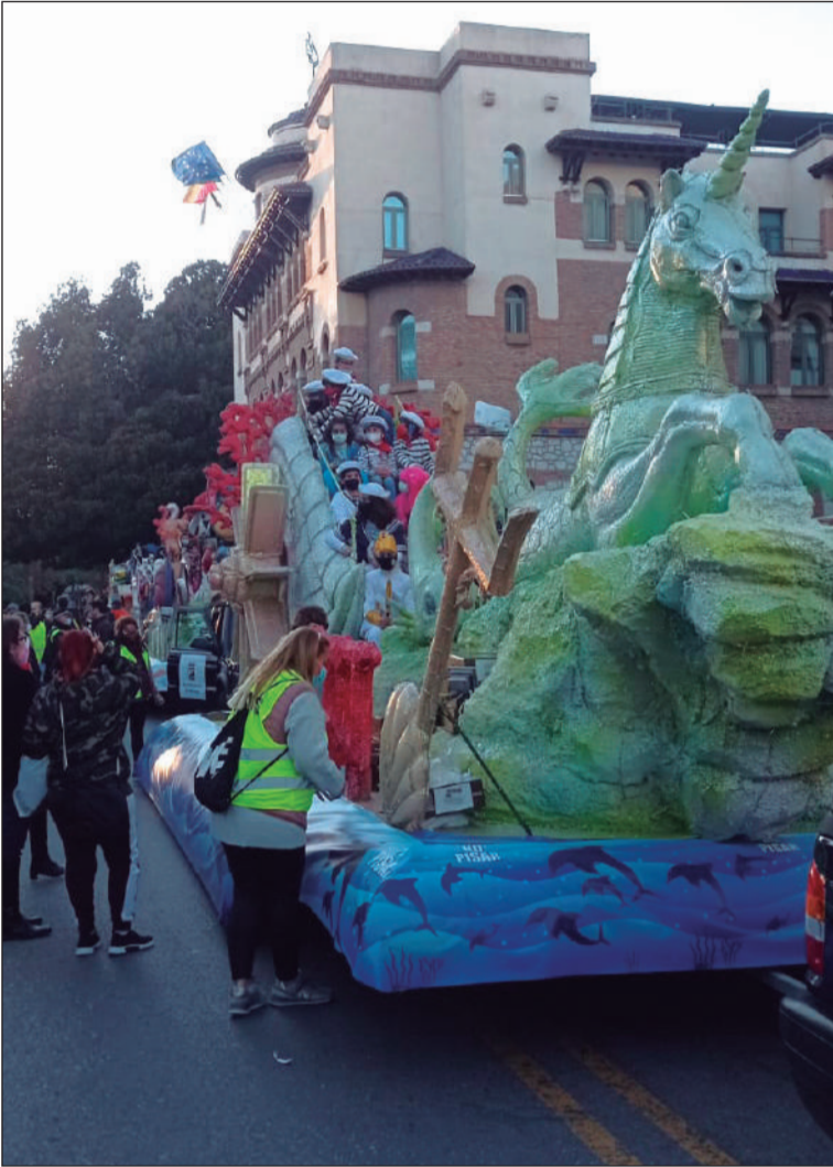
Vista del unicornio que encabezaba esta carroza de fantasía.