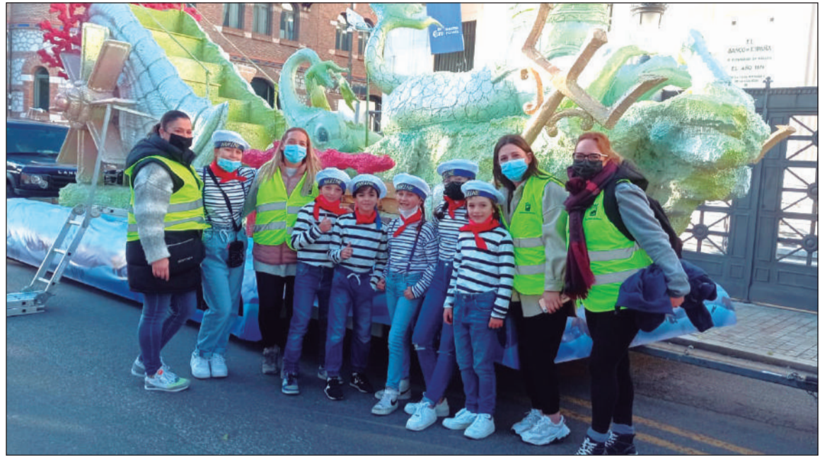
Niños y voluntarios de la Peña Nueva Málaga ante la carroza.