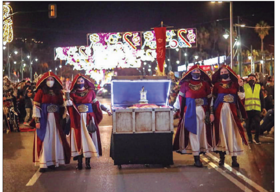
Detalles del cortejo real, con ofrendas para el Niño Jesús.