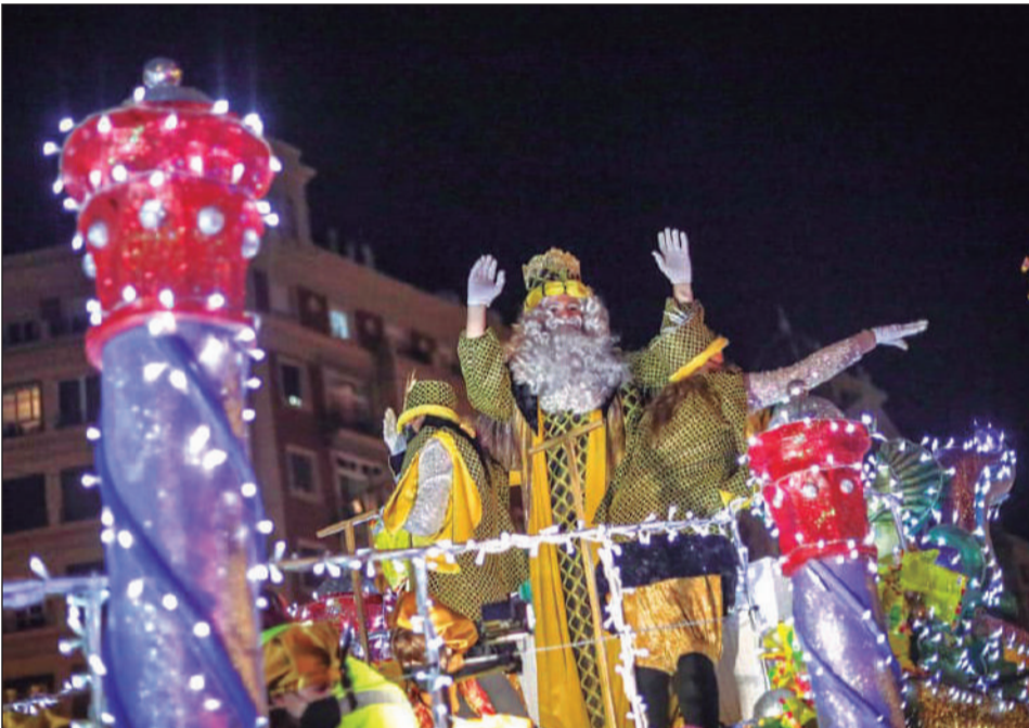
El Rey Melchor saluda desde su carroza a todos los niños y mayores.