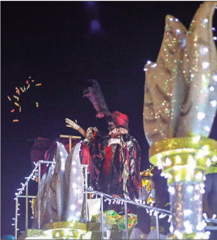
Baltasar lanza caramelos desde su carroza.

7.000 kilos de caramelos sin gluten y 5.000 kilos de gominolas.