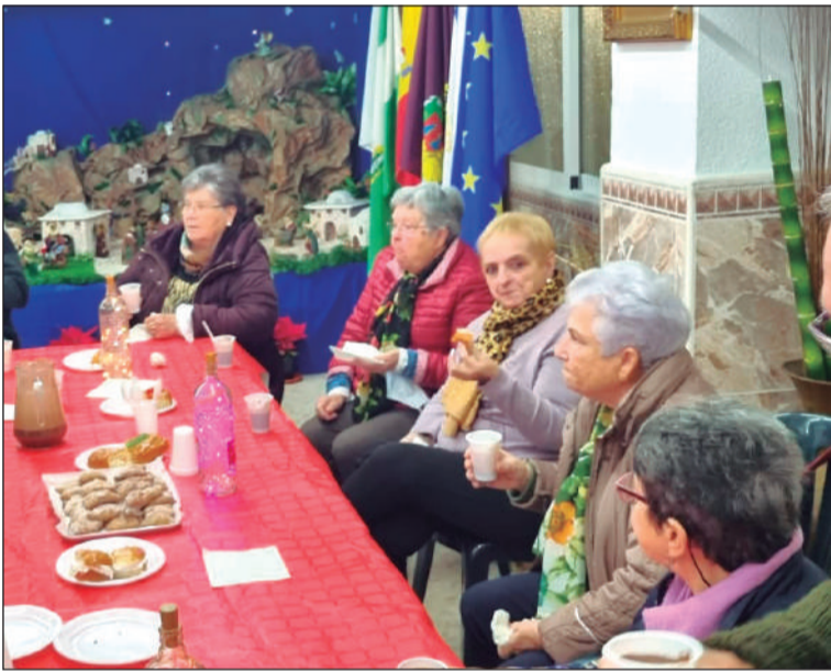
Socias degustando los dulces típicos en la Noche de Reyes.