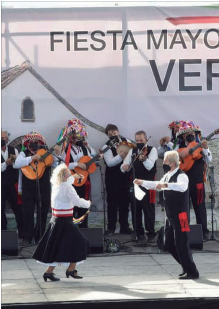
Baile de Verdiales en el Puerto de la Torre.