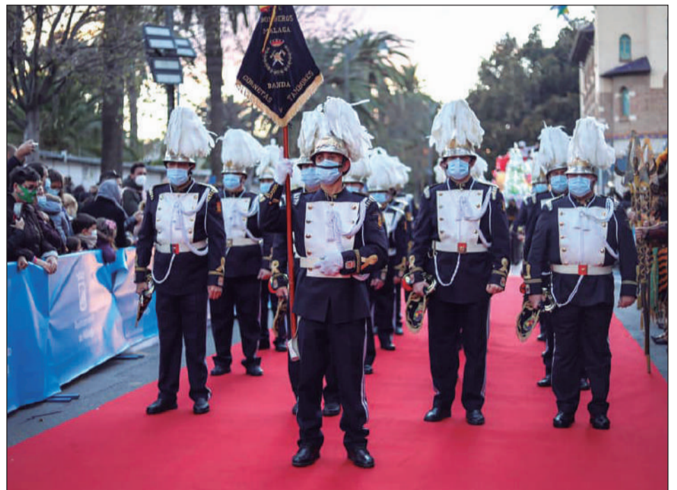
La Banda del Real Cuerpo de Bomberos de Málaga volvió a abrir el cortejo de la cabalgata.