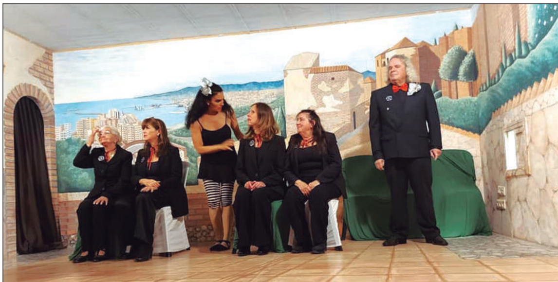
Espectáculo ofrecido en la sede de la Peña La Biznaga.

Además, el 6 de enero estaba anunciada la visita de los Reyes Magos a esta entidad.