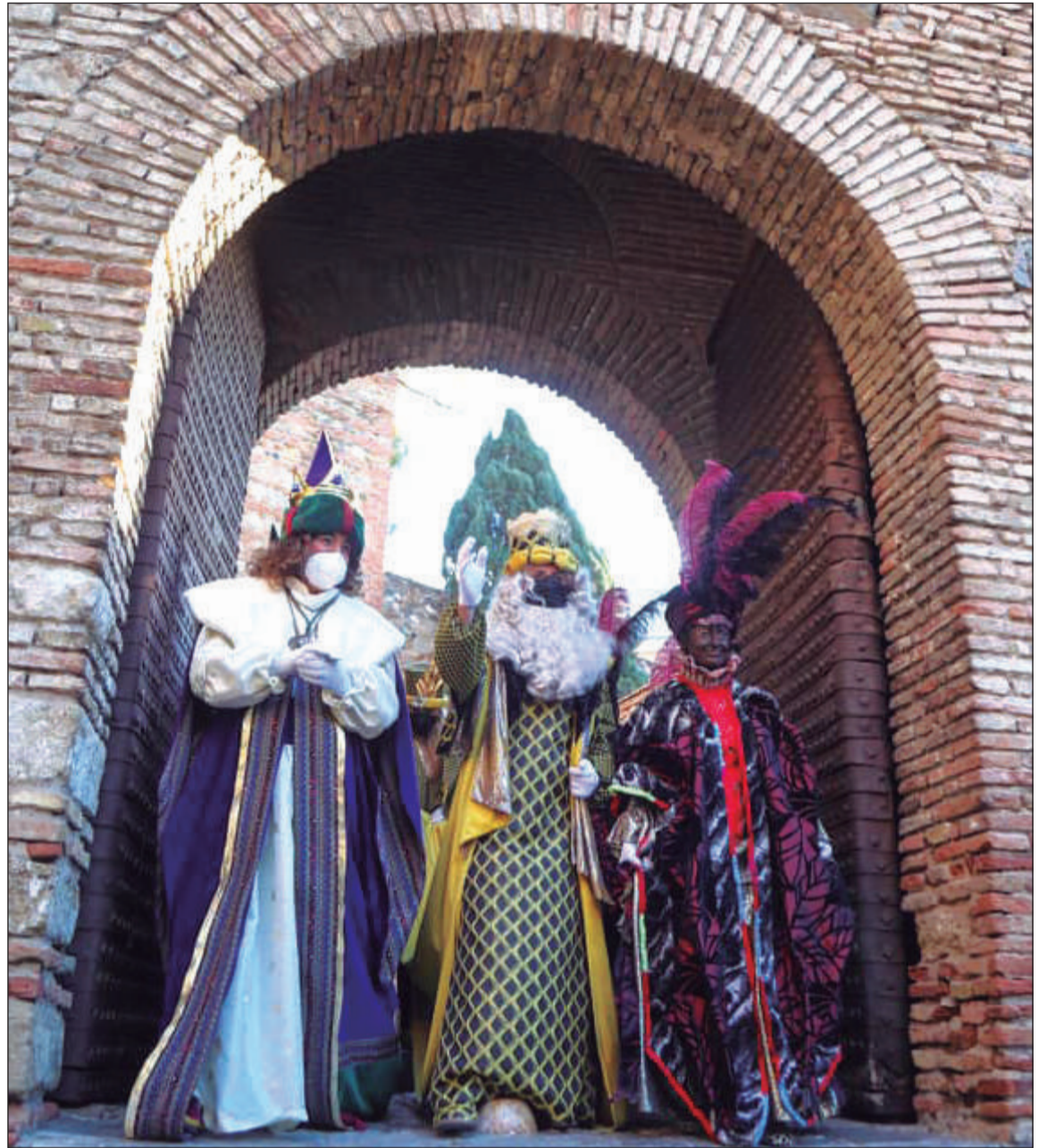
Los Reyes Magos pasaron la noche en el Palacio de la Alcazaba.

La cabalgata estuvo integrada un total de 13 carrozas: tres carrozas reales y 10 de acompañamiento, entre las que se encontraba la ocupada por miembros de la Federación Malagueña de Peñas, Centros Culturales y Casas Regionales 'La Alcazaba'.