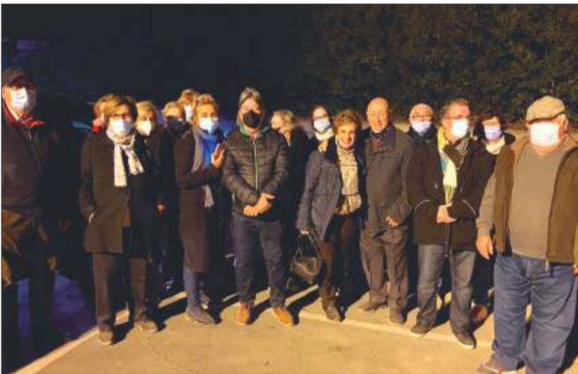
Grupo de peñistas participantes en esta actividad.