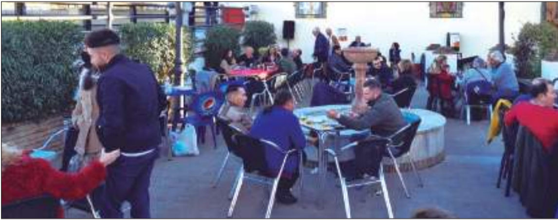
Imagen de la actividad benéfica organizada por la Cofradía de la Pollinica.

hecho presente con la celebración en la plaza Paco Márquez de la gala 'Ningún niño sin juguetes' de la Cofradía de la Pollinica.