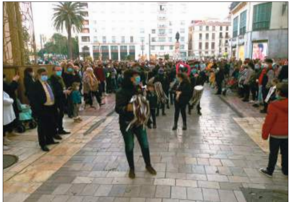
Peña Los Penosos.