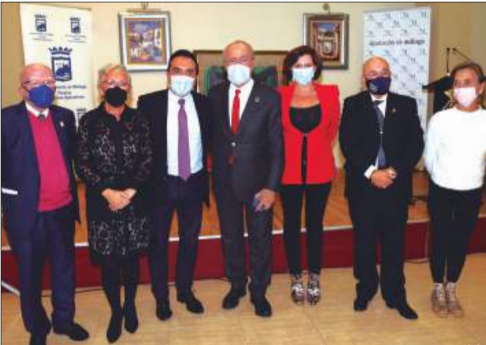
Asistentes al XL Aniversario de la Federación Malagueña de Peñas.