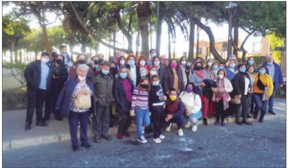
Socios durante la excursión a Almería.