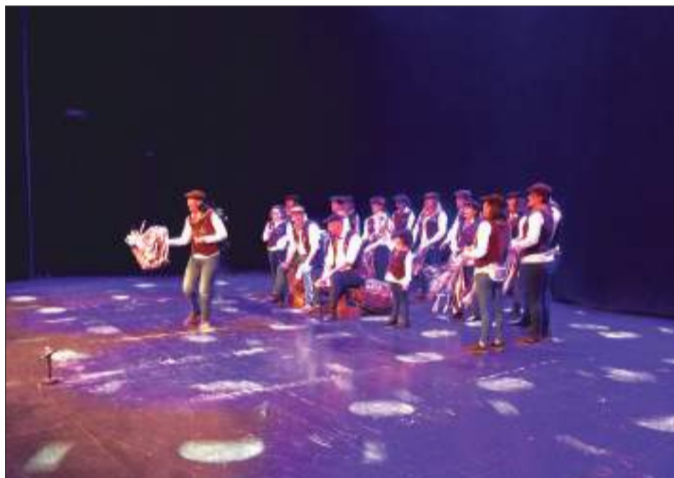
Peña Los Penosos.