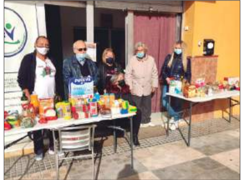
Voluntarios durante la campaña de recogida de alimentos.

Por otra parte, socios de esta entidad federada participaban el pasado sábado 11 de diciembre en una excursión cultural a Almería.