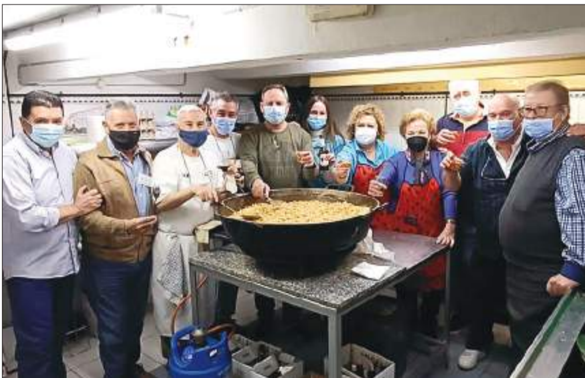
Miembros de la directiva preparando unas migas.

Al día siguiente tenía lugar la comida mensual de primero de mes a cargo del grupo de la directiva, que deleitaron con un menú de campeonato compuesto por patatas fritas y aceitunas, embutidos, tosta de zurrapa, salpicón de marisco, migas completas y arroz con leche.