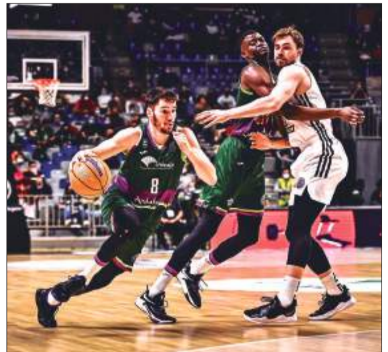
Imagen de un encuentro del Unicaja Baloncesto.

Una vez acabado el plazo, desde el Club se enviará al correo electrónico de cada peñista la invitación del partido.