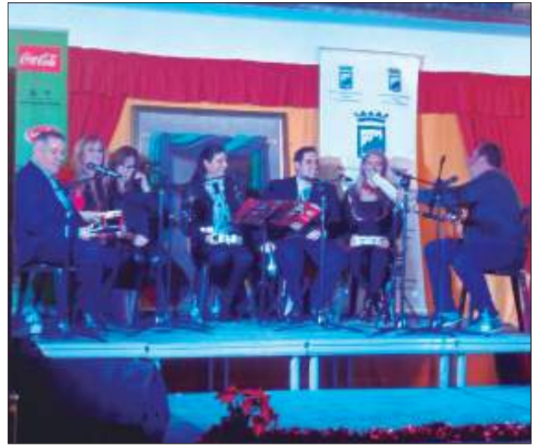
Zambomba de la Escuela de Copla 'Miguel de los Reyes'.