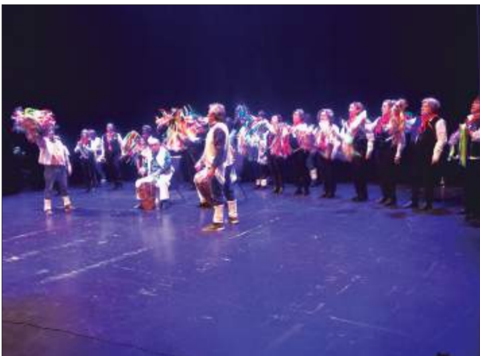
Peña Montesol Las Barrancas.