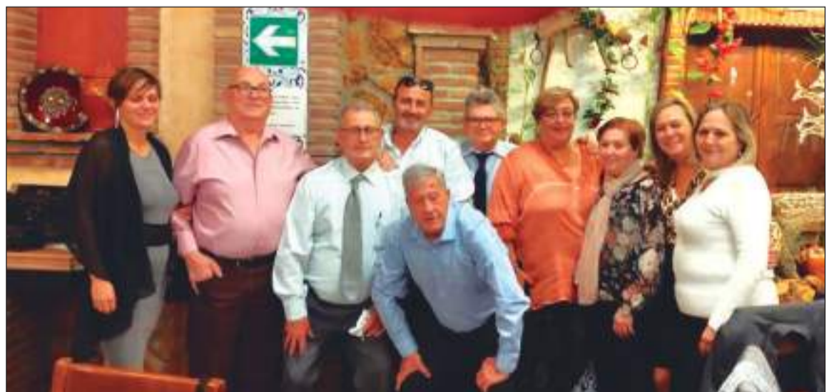
Integrantes de las entidades en este acto.