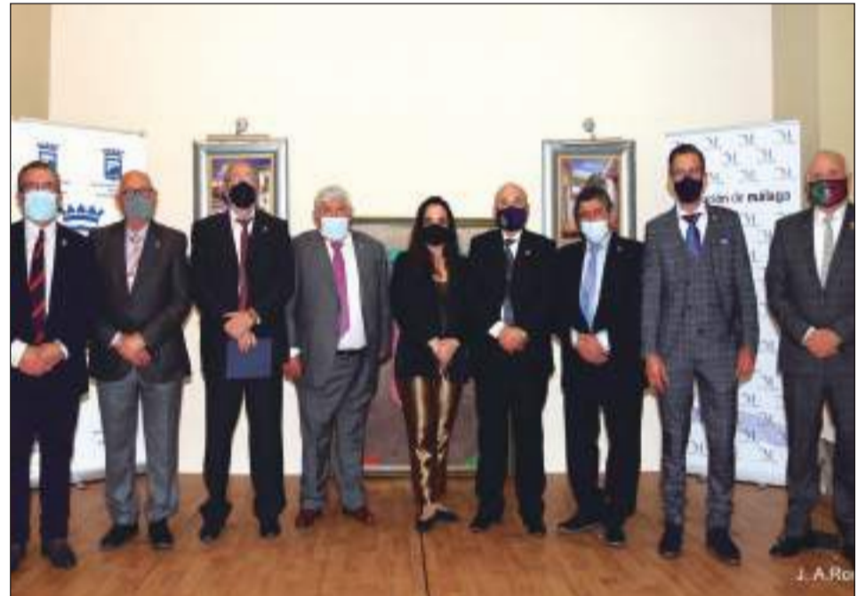
Junta Directiva de la Federación Malagueña de Peñas.