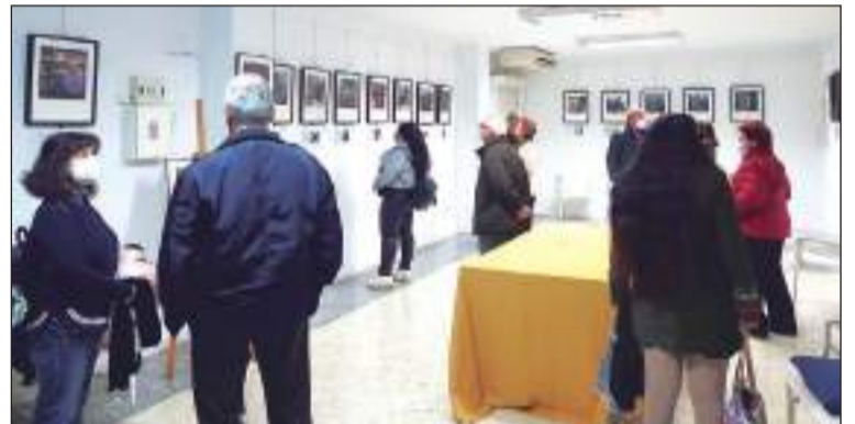
Inauguración de la exposición.