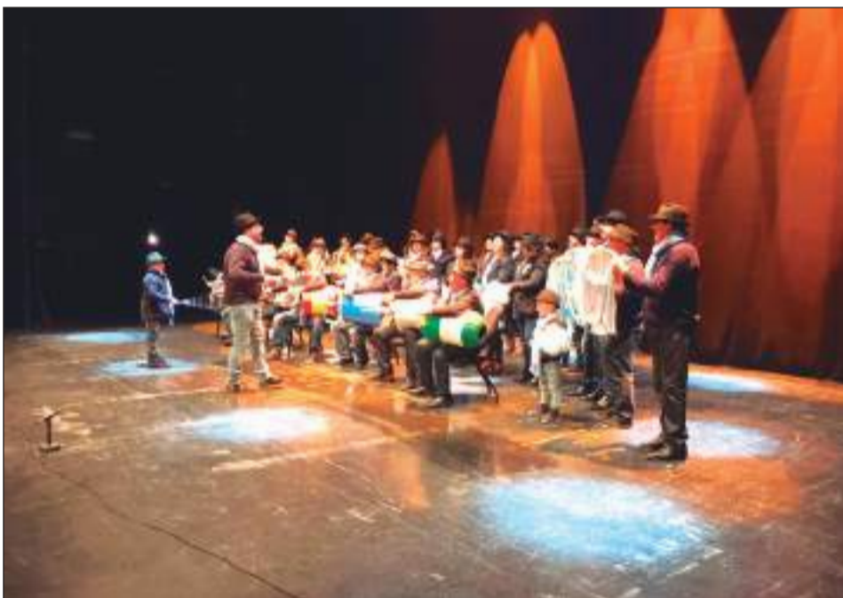
Pastoral La Parranda de Manilva.