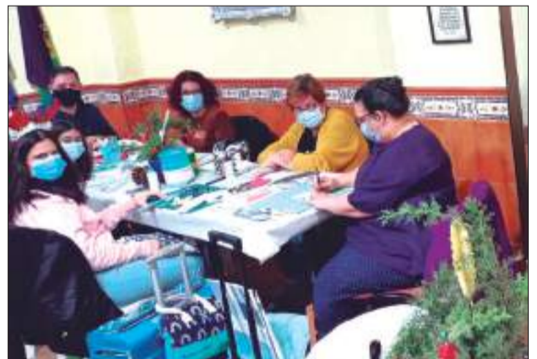
Socios durante el taller impartido.