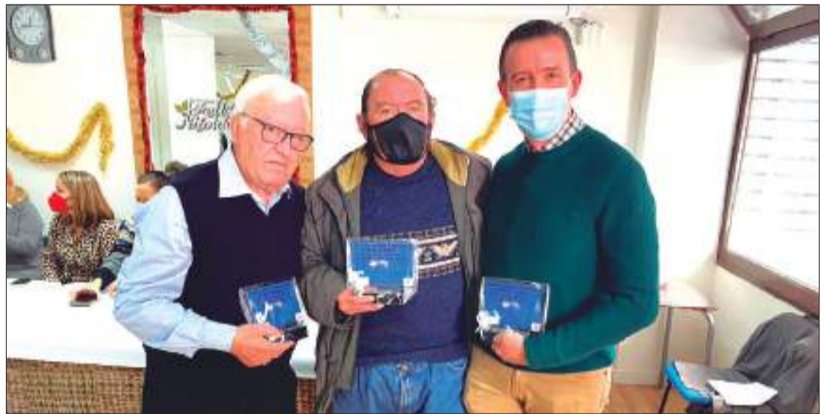
Entrega de premios en las diferentes categorías.