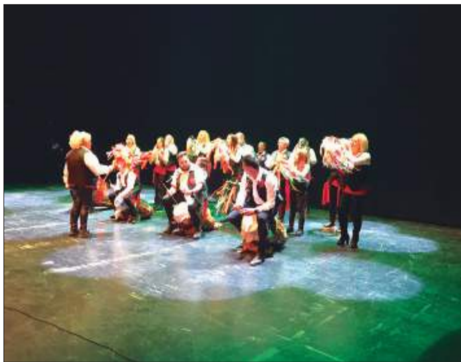
Pastoral El Chavea de Algarrobo.