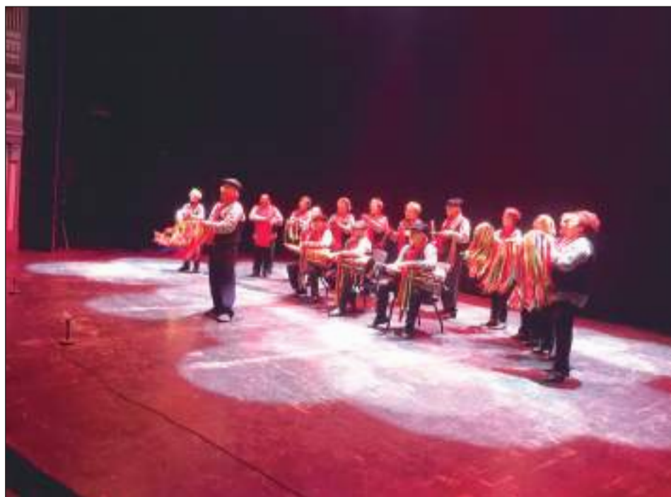
Pastoral Esta Gente de la Casa de Álora Gibalfaro.