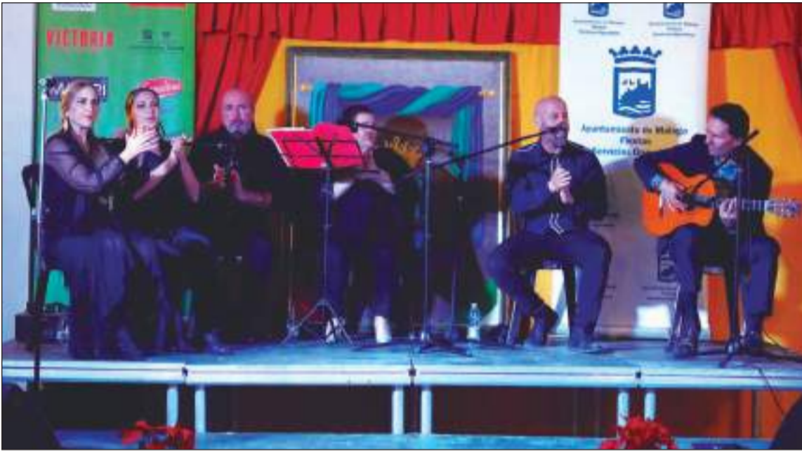
Zambomba ofrecida por la Peña Juan Brea.

• FEDERACIÓN MALAGUEÑA DE PEÑAS, CENTROS CULTURALES Y CASAS REGIONALES 'LA ALCAZABA'