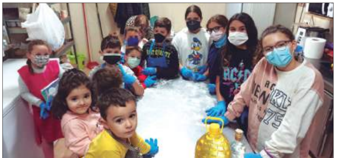
Pequeños participantes en el taller gastronómico.

Por otra parte, el Centro Cultural Renfe prepara su Cena de Nochevieja, con la que los socios de esta entidad perteneciente a la Federación Malagueña de Peñas, Centros Culturales y Casas Regionales 'La Alcazaba' despedirán unidos este año y darán la bienvenida a 2022.