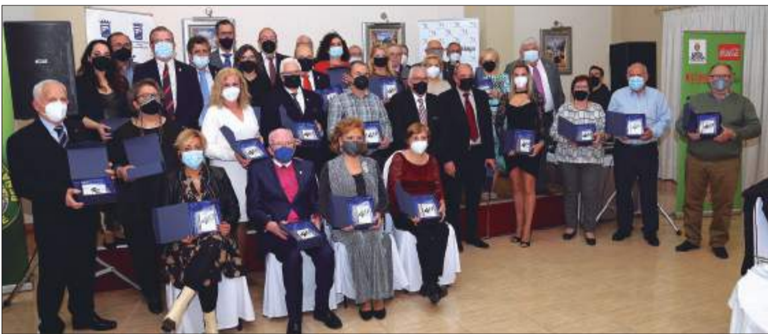
La Federación Malagueña de Peñas celebraba su XL Aniversario con una cena de gala en el Hotel El Romerito.

Web: www.femape.com Edición digital: www.femape.com/laalcazabadigital Twitter: @FMPLaAlcazaba Facebook: FMPLaAlcazaba