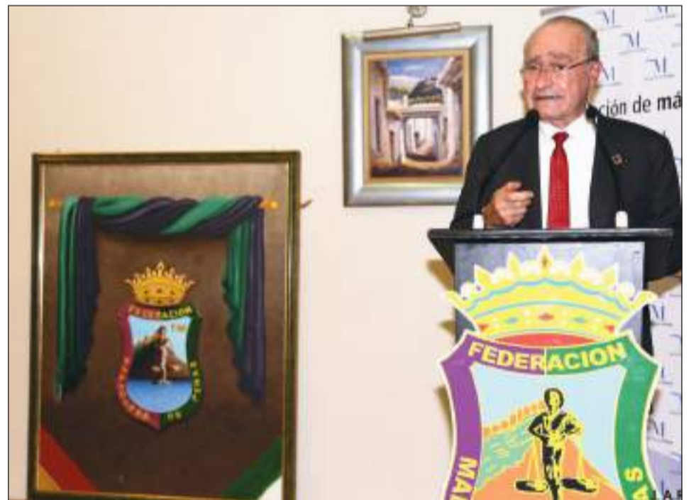
El alcalde, Francisco de la Torre, durante su intervención para cerrar el acto.