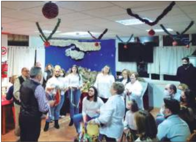
Pastoral cantando ante el Belén.

Además, unos días antes, los socios se reunían para degustar unos callos en el transcurso de una jornada de hermandad peñista.