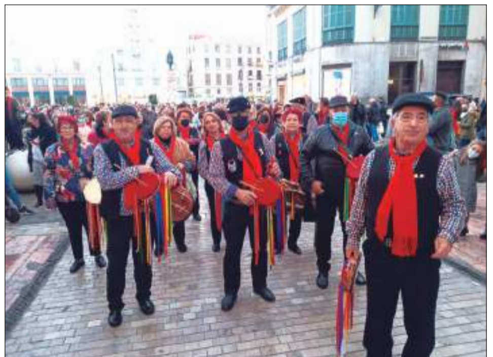
Pastoral Esta Gente de la Casa de Álora Gibralfaro.