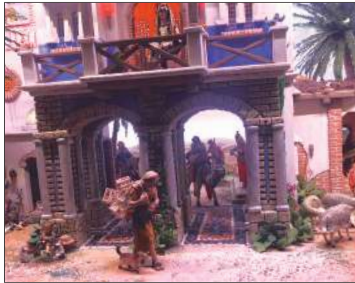
Detalle del Belén de la Asociación Juan Navarro.

La Asociación Folclórico Cultural 'Juan Navarro' se ha proclamado ganadora del XXX Certamen de Belenes. Segunda clasificada ha sido la Asociación de Vecinos Hanuca, y tercera la Casa de Melilla. El Premio Especial del Jurado fue para la Peña San Vicente, y el del Belén Más Tradicional para la Asociación de Vecinos Victoriana de Capuchinos.