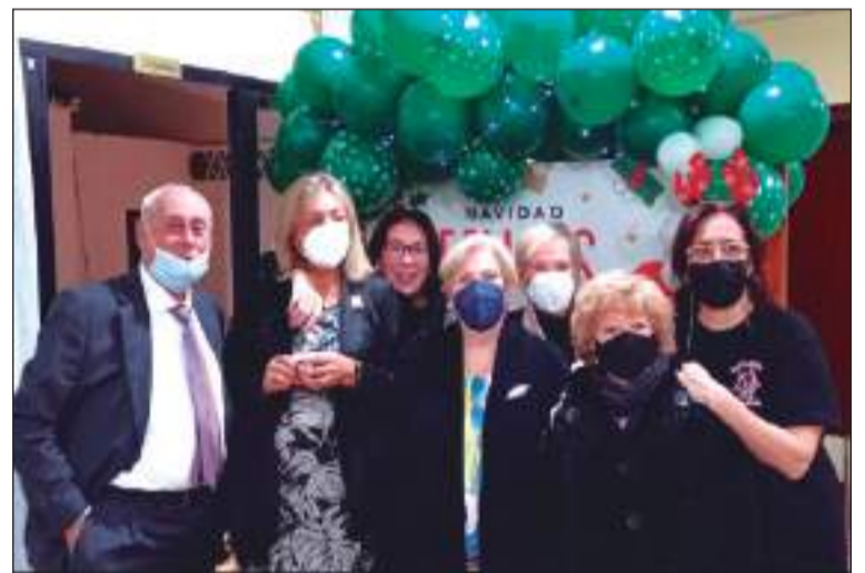
La presidenta y miembros de la entidad con la organizadora.

Todos los asistentes pudieron disfrutar de este encuentro con taller de manualidades y merienda como actividad previa a estas fechas.