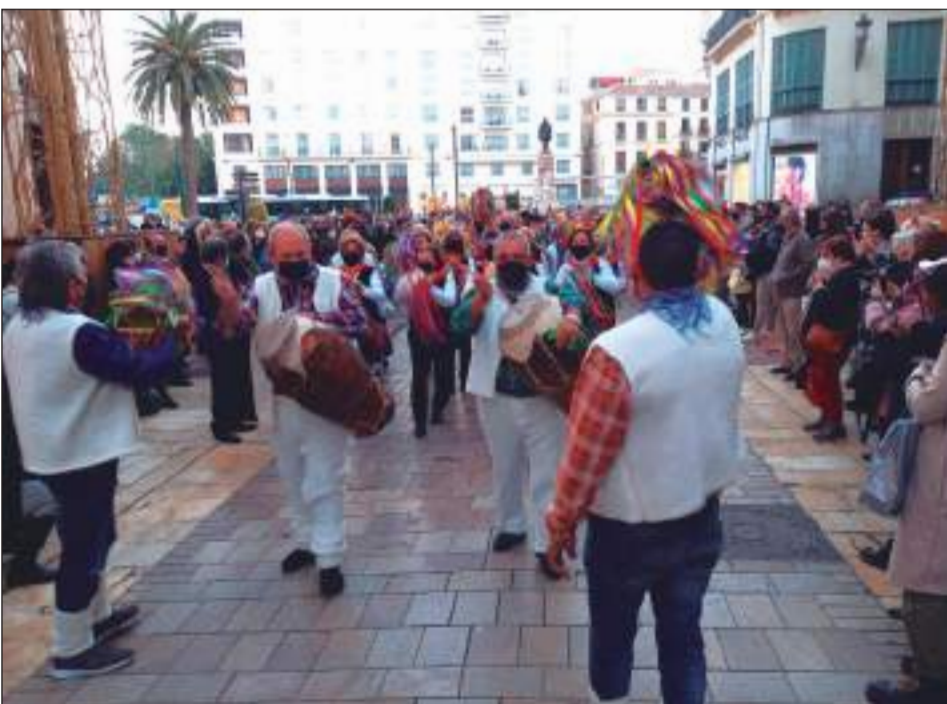
Peña Montesol Las Barrancas.