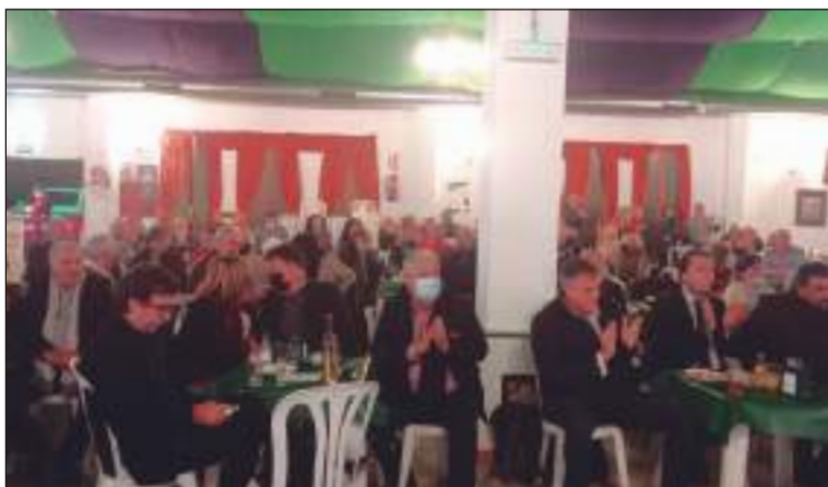
Se contó con autoridades y peñistas en esta actividad.

Entre todos facilitaron una tarde-noche entrañable, en la que se contó con una barra con precios populares.