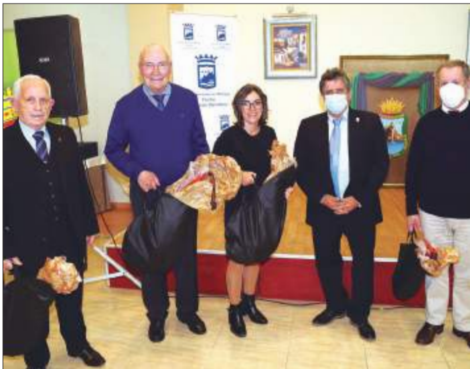
Ganadores de un jamón por gentileza de Famadesa.