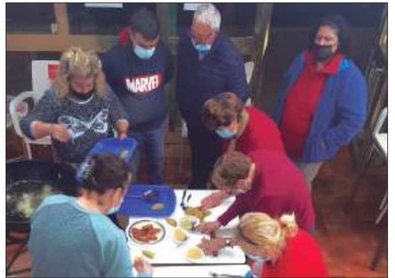
Inauguración del Belén de la Peña El Palustre.

navideña de esta entidad federada en los últimos días, ya que el domingo 19 tenían prevista una excursión a la localidad cordobesa, famosa por su elaboración de anís y dulces; además de por su Belén de Chocolate.