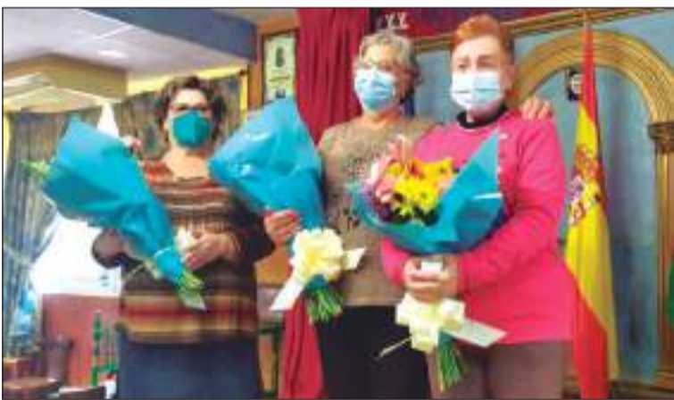
Escudos de Plata de la entidad.