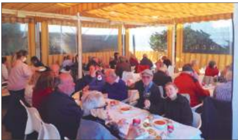
Socios disfrutando de los callos preparados el 4 de diciembre.