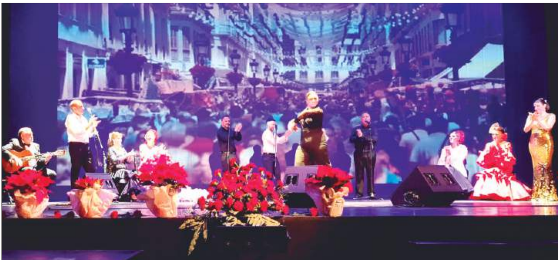
Un instante del espectáculo ofrecido el pasado 10 de diciembre por la Federación Malagueña de Peñas en el Teatro Cervantes.

• FEDERACIÓN MALAGUEÑA DE PEÑAS, CENTROS CULTURALES Y CASAS REGIONALES 'LA ALCAZABA'