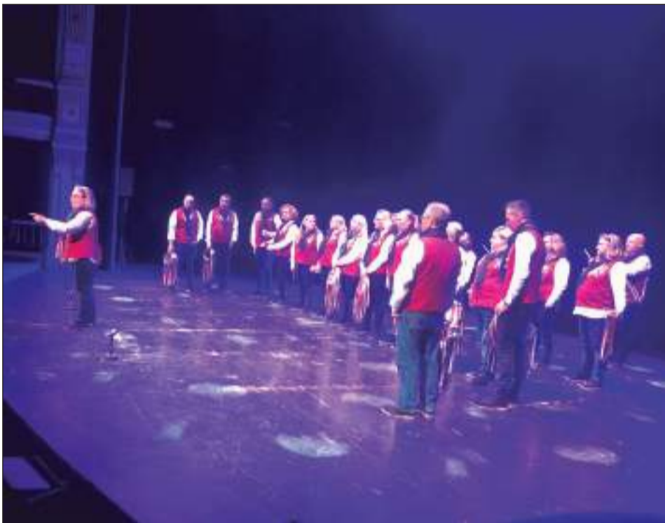
Pastoral Peña Santa Cristina.