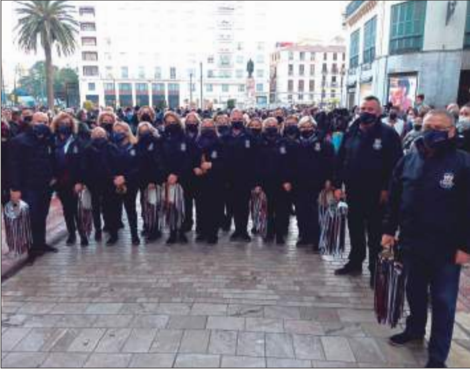
Pastoral Peña Santa Cristina.