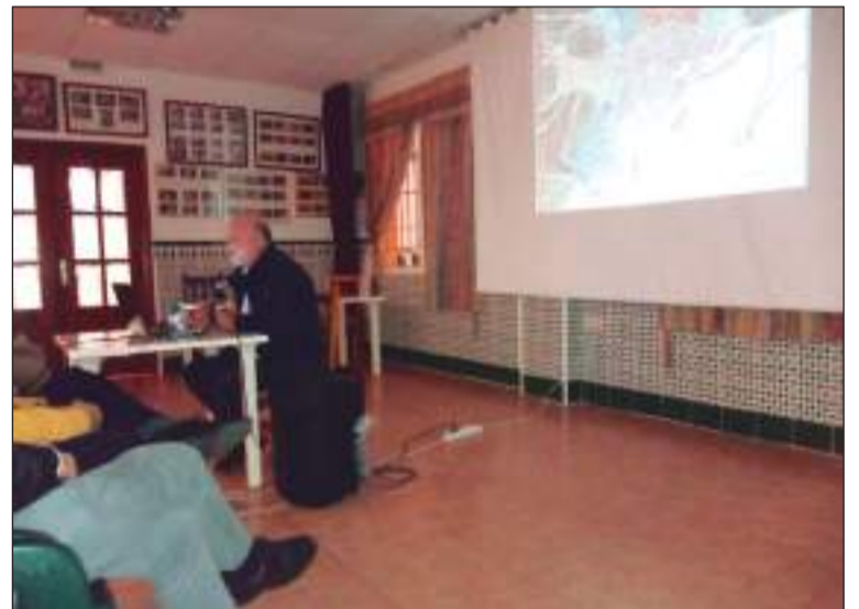
El ciclo arranca en la Peña Perchelera, con una conferencia sobre el barrio.