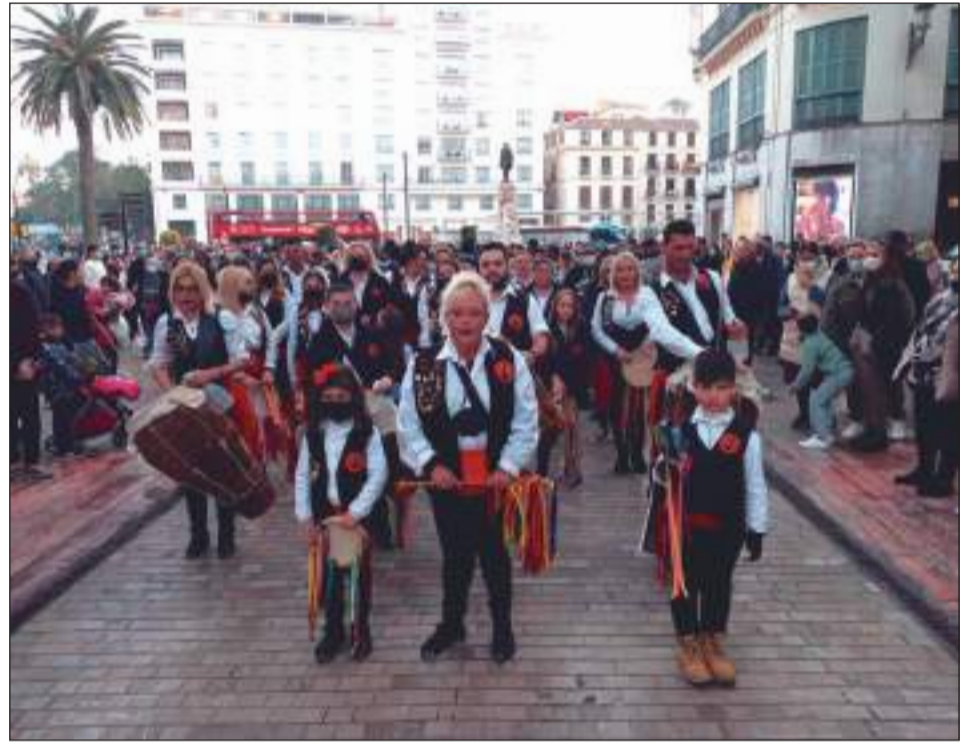
Pastoral El Chavea de Algarrobo.