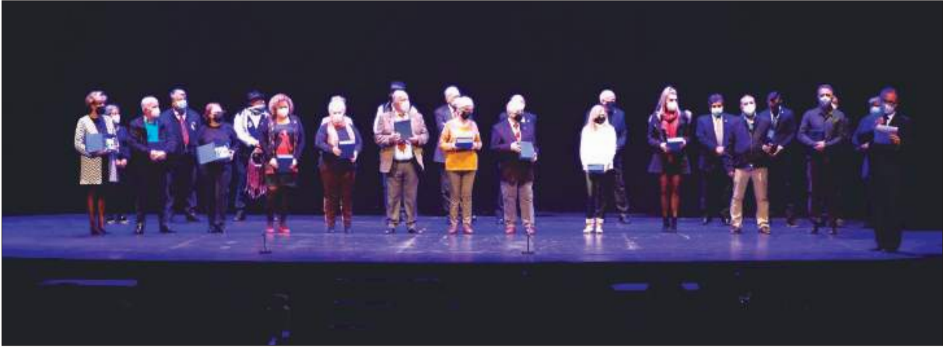
Acto de entrega de premios en el Teatro Cervantes.