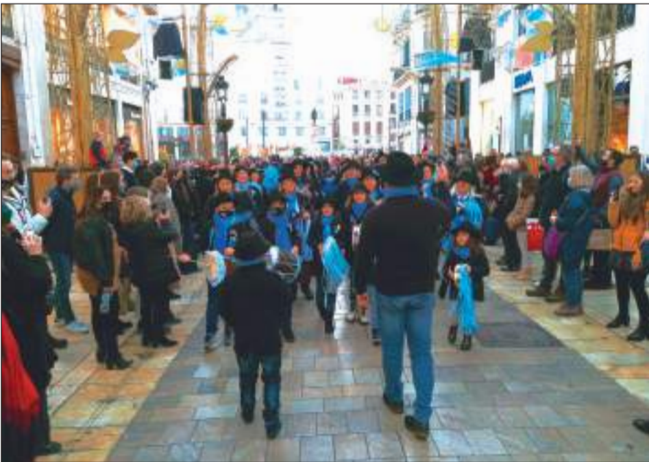
Pastoral La Parranda de Manilva.