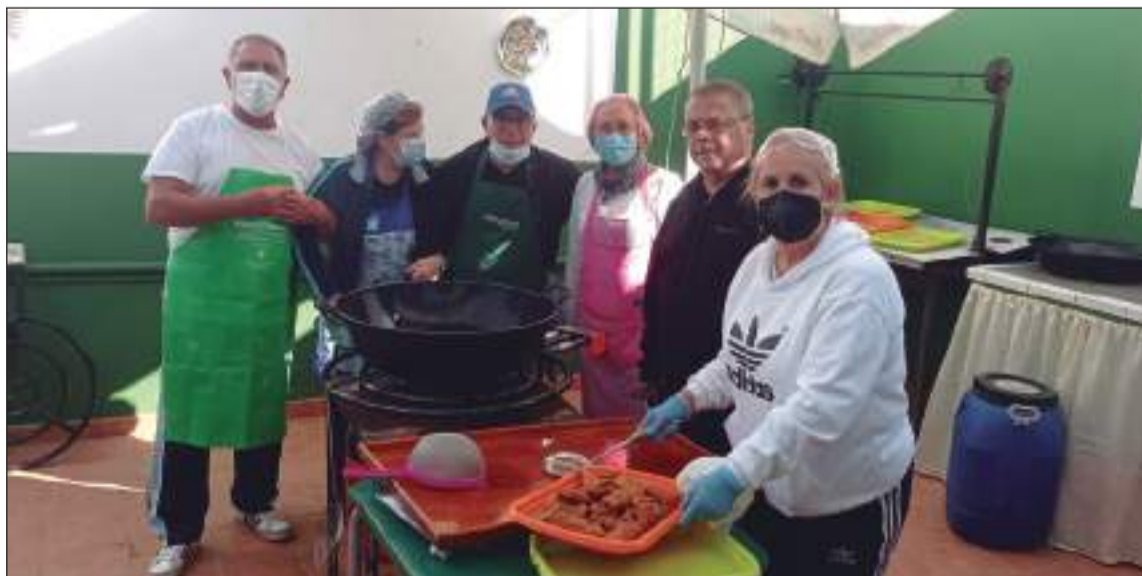
Socios elaborando los borrachuelos.

como no, los villancicos de su pastoral. Además, los socios han elaborado los dulces tradicionales de estas fechas,