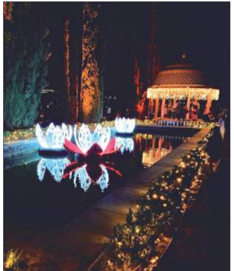
Imagen del Jardín de La Concepción esta Navidad.

Así, los asistentes pudieron disfrutar de una velada agradable y romántica en un recorrido