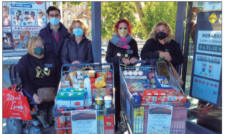
Voluntarios en la recogida de alimentos en un supermercado.

Por otra parte, la Asociación vivió el pasado viernes la inauguración del mayor abeto natural de la ciudad, del alumbrado de la sede y del magnífico nacimiento con detalles del barrio.