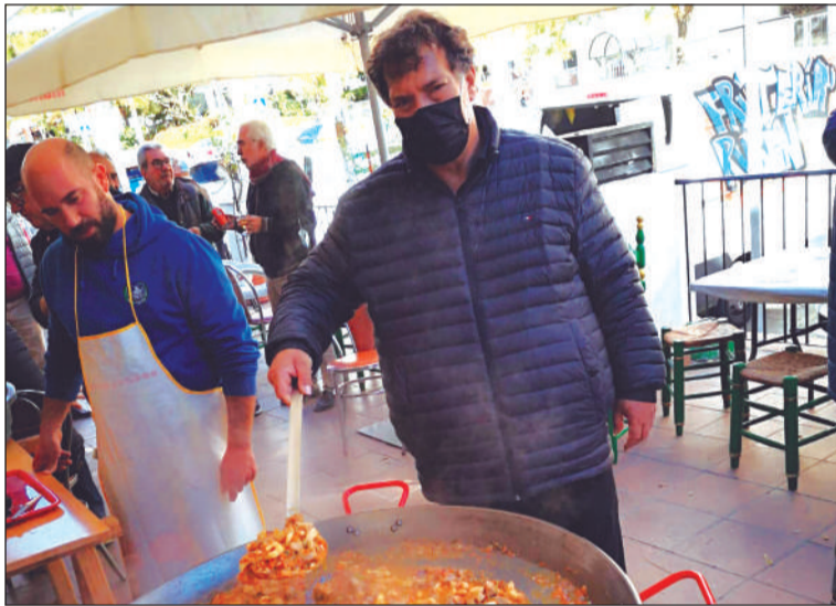
El presidente, preparando el arroz.

neciente a la Federación Malagueña de Peñas, Centros Culturales y Casas Regionales 'La Alcazaba' se reunían para compartir un almuerzo y disfrutar de una velada de cante flamenco.