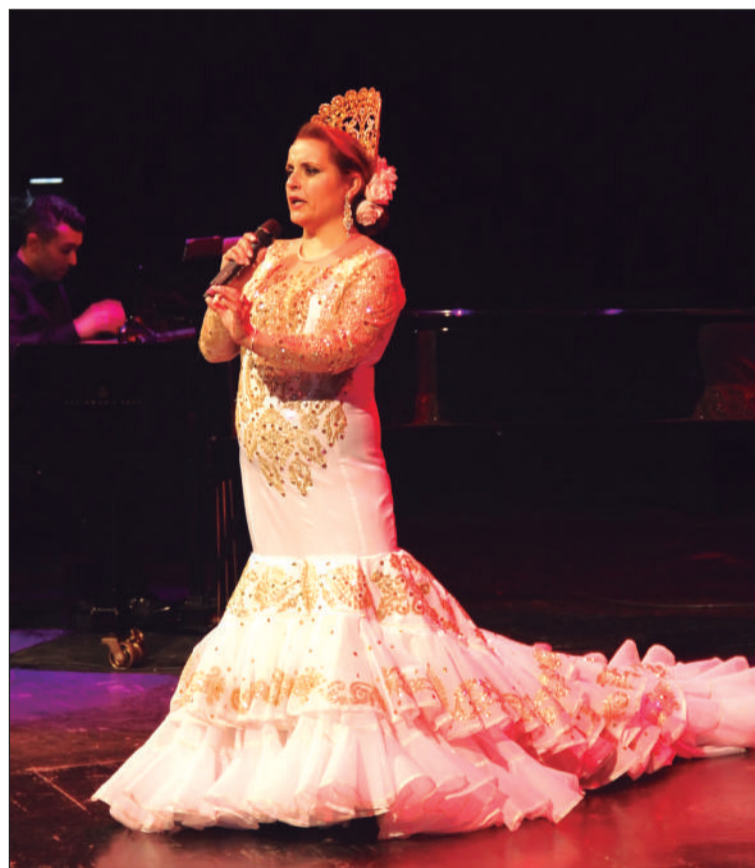
El Teatro Cervantes acogió la final del certamen.