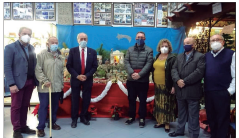
Inauguración del Belén de la Peña El Palustre.

Además, la entidad cuenta con el Árbol de los Deseos en el que las personas que quisieron pudieron escribir el suyo.