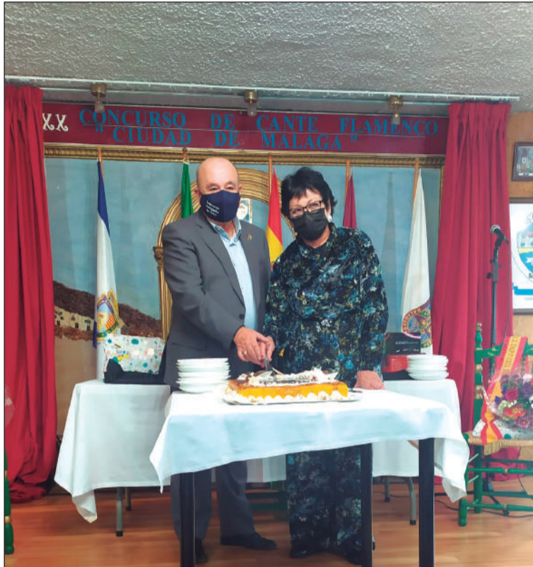
El presidente de la Federación y la presidenta de la entidad cortan la tarta.

Finalmente, el lunes 6 se ofrecía arroz y pescados para todos los socios y sus familias, en una jornada de hermandad para todos los componentes de esta entidad perteneciente a la Federación Malagueña de Peñas, Centros Culturales y Casas