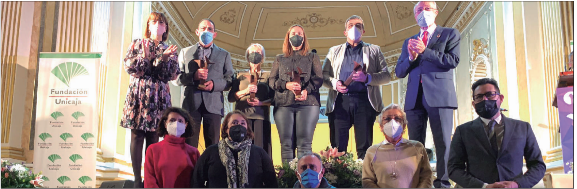
Acto de entrega de premios, con la asistencia de autoridades y representantes de las entidades galardonadas.