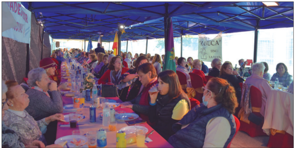
Vista general de la carpa instalada en el exterior de la sede.