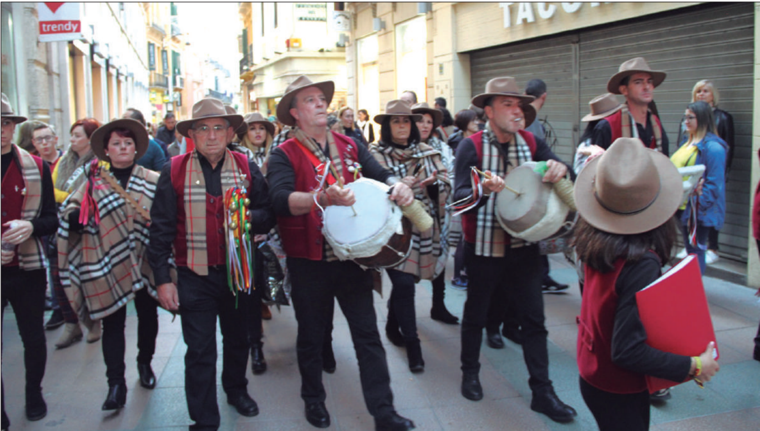
Las pastorales volverán a recorrer las calles del Centro Histórico tras un año de ausencia.