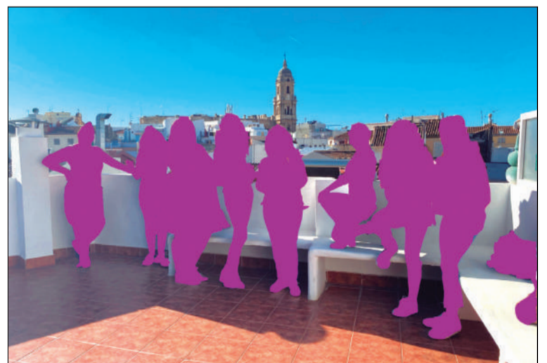
Usuaris del taller durante una de las actividades realizadas.