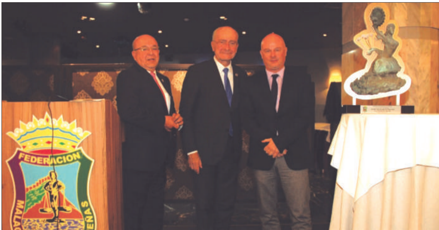
La Fundación Unicaja recibía el Premio Malagueño de Pura Cepa en su última edición de 2019.