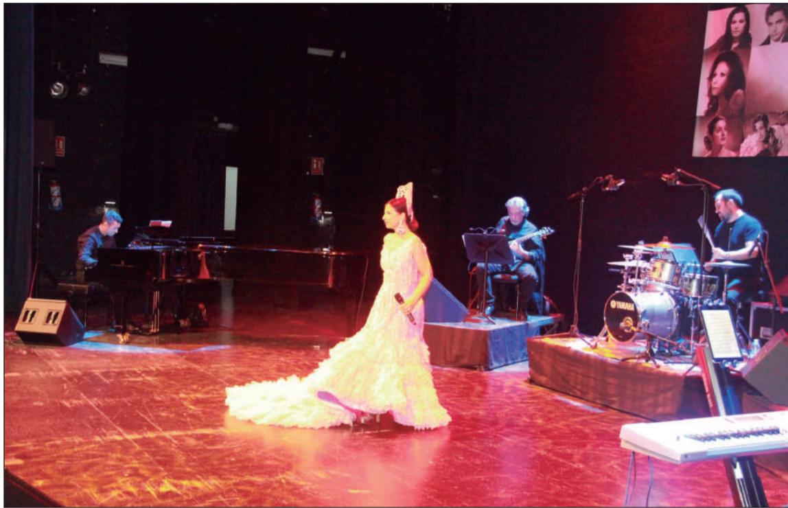
El Certamen Nacional de Copla 'Costa del Sol' ofreció un gran espectáculo.