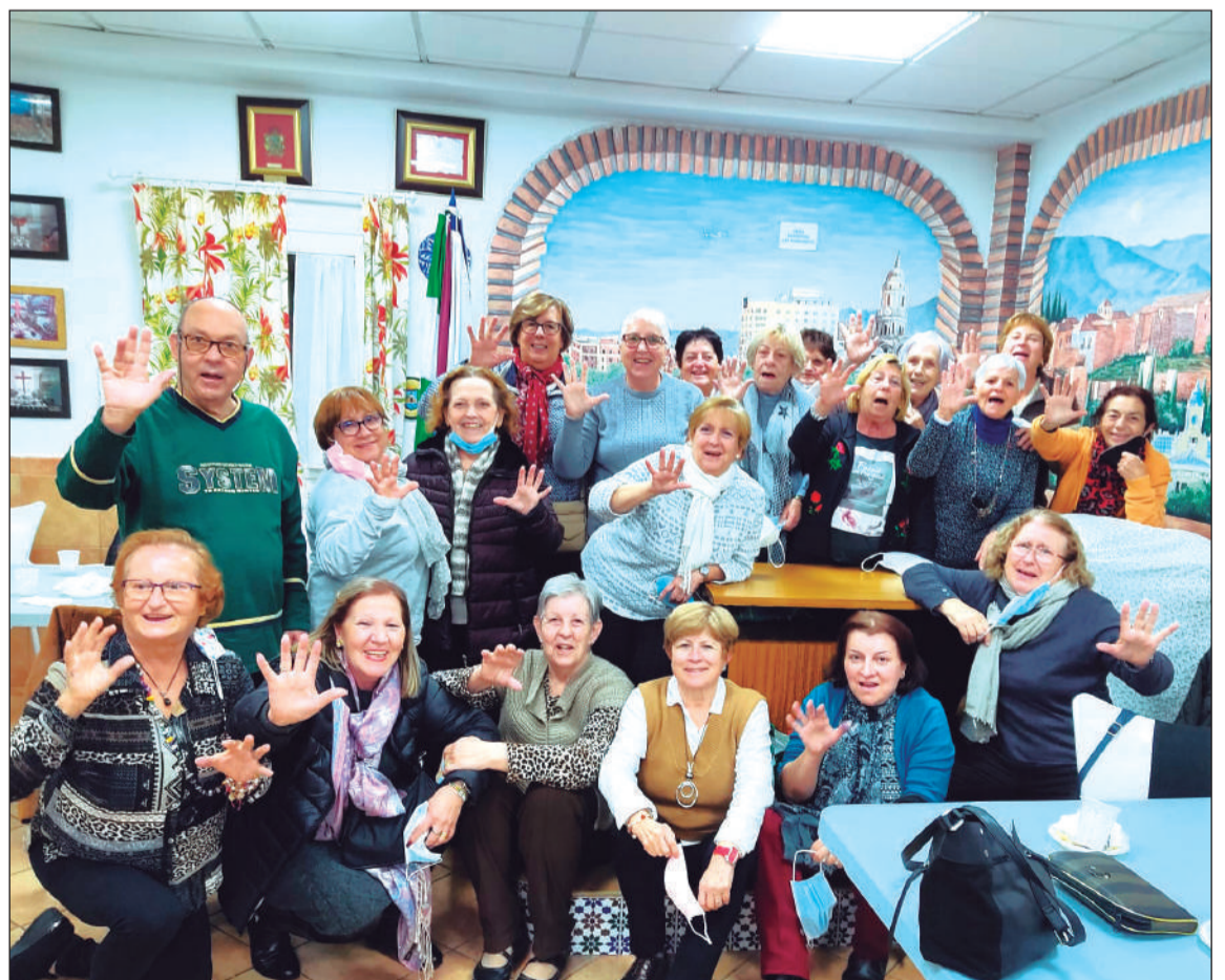
Socios de la entidad en una reciente actividad.

El 28 de diciembre, por su parte, será la Fiesta de los Niños con payasos y merienda desde las 18:30 horas.