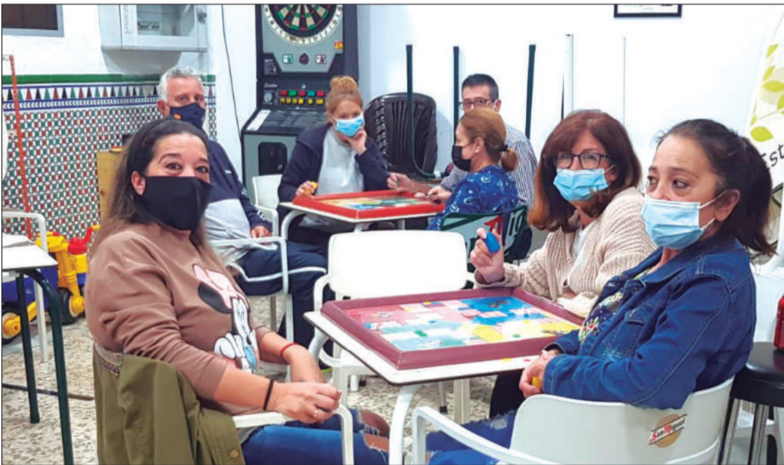
Un instante de la competición que se disputa en la sede de la entidad.

perteneciente a la Federación Malagueña de Peñas, Centros Culturales y Casas Regionales 'La Alcazaba'.