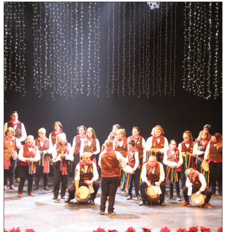
Una de las pastorales actúa en el Cervantes en el encuentro de 2019.