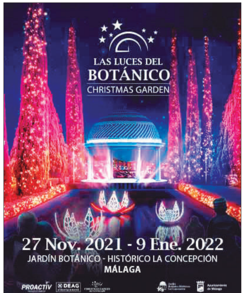
Cartel de esta actividad.

Los participantes podrán disfrutar de una velada agradable y romántica en un recorrido circular de unos 2,2 kilómetros de