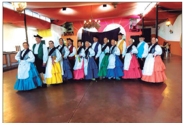
Imagen del grupo de la asociación.

Culturales y Casas Regionales 'La Alcazaba', ha colaborado en los Callos Solidarios organizado por la Asociación Parroquial de San Juan Bautista de Torremolinos a favor de Cáritas.