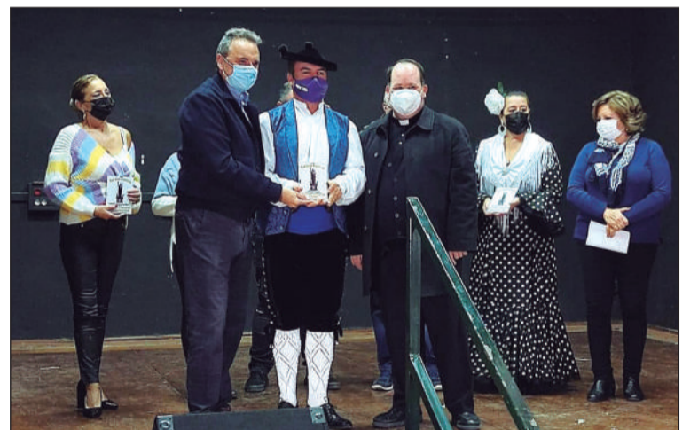
Entrega de un recuerdo en agradecimiento a la participación del grupo.