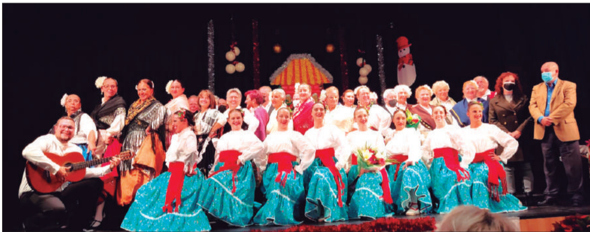
Imagen de grupo de los participantes en el retablo Navideño 2021, con la presencia del presidente de la Federación.

espectáculo, con nuevo vestuario, que suponía el retorno de esta tradicional actividad de esta entidad federada.