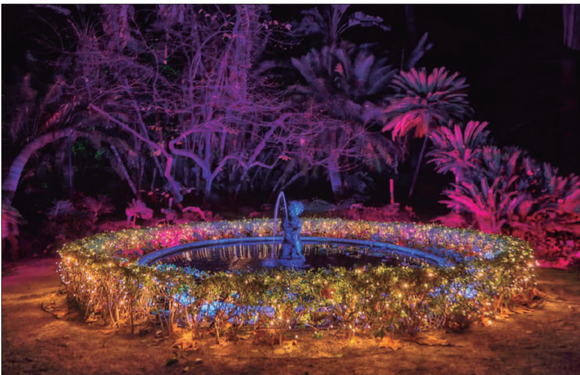
Imagen del Jardín de La Concepción esta Navidad.