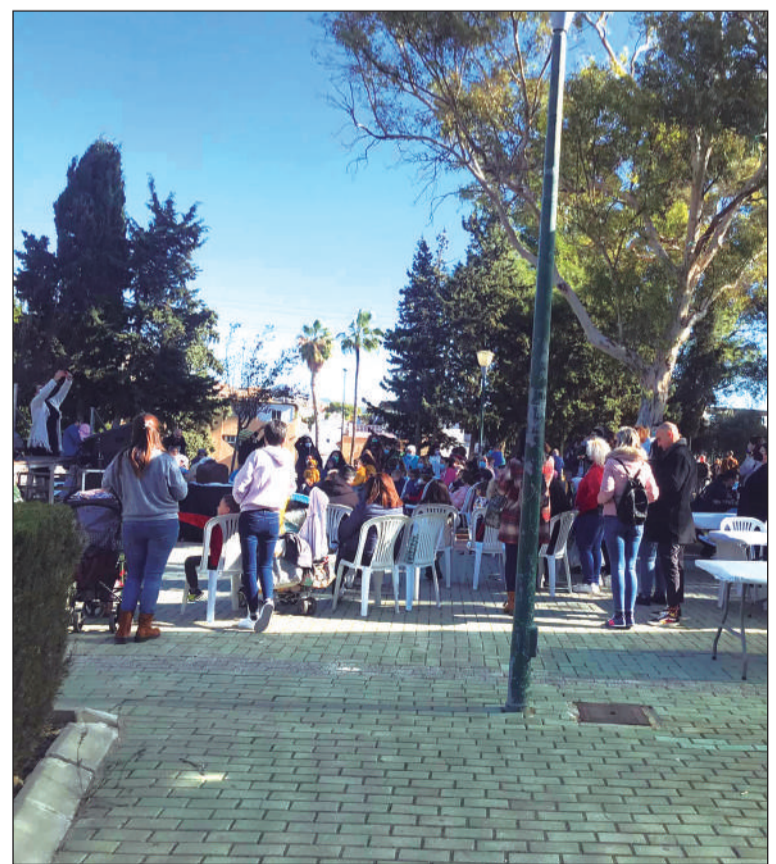
Uno de los talleres celebrados.