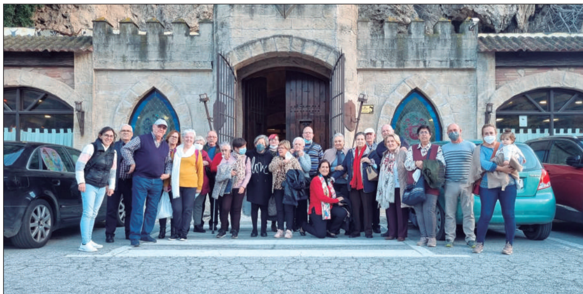
Imagen de grupo de los participantes en esta excursión.

hasta donde se desplazaba un grupo para pasar un fin de semana muy especial para todos los asistentes.