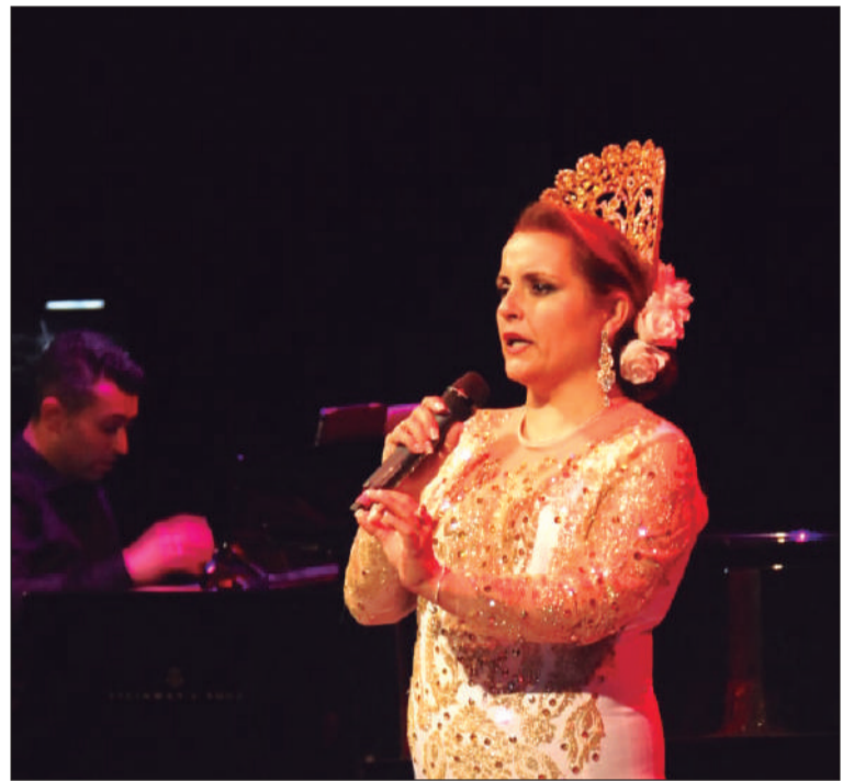
Ilustración de la conferencia por uno de los alumnos.