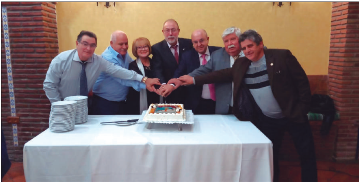
Corte de la tarta conmemorativa del XLIX Aniversario de la Peña Perchelera.

conmemoraba el 49 aniversario de esta entidad perteneciente a la Federación Malagueña de Peñas, Centros Culturales y Casas Regionales 'La Alcazaba' con una cena de gala con música en un restaurante.