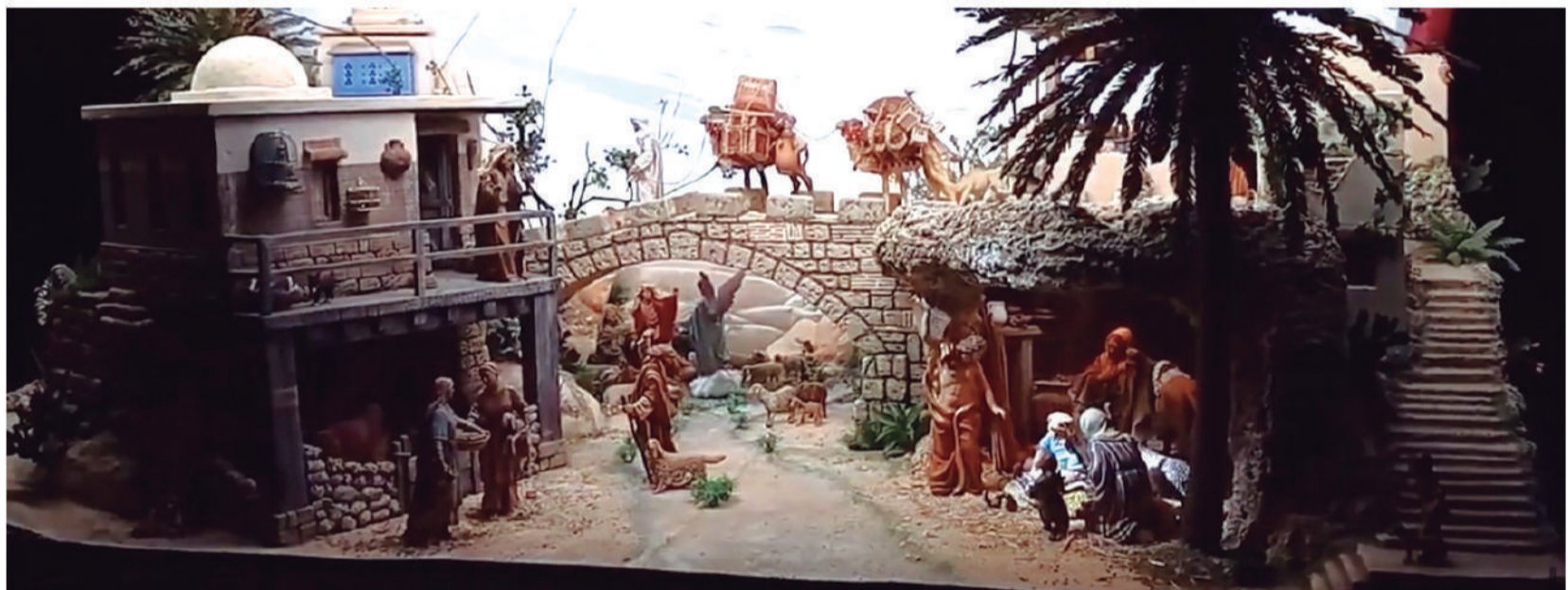
Belén de la Asociación Folclórica Cultural 'Juan Navarro'. Primer premio 2020