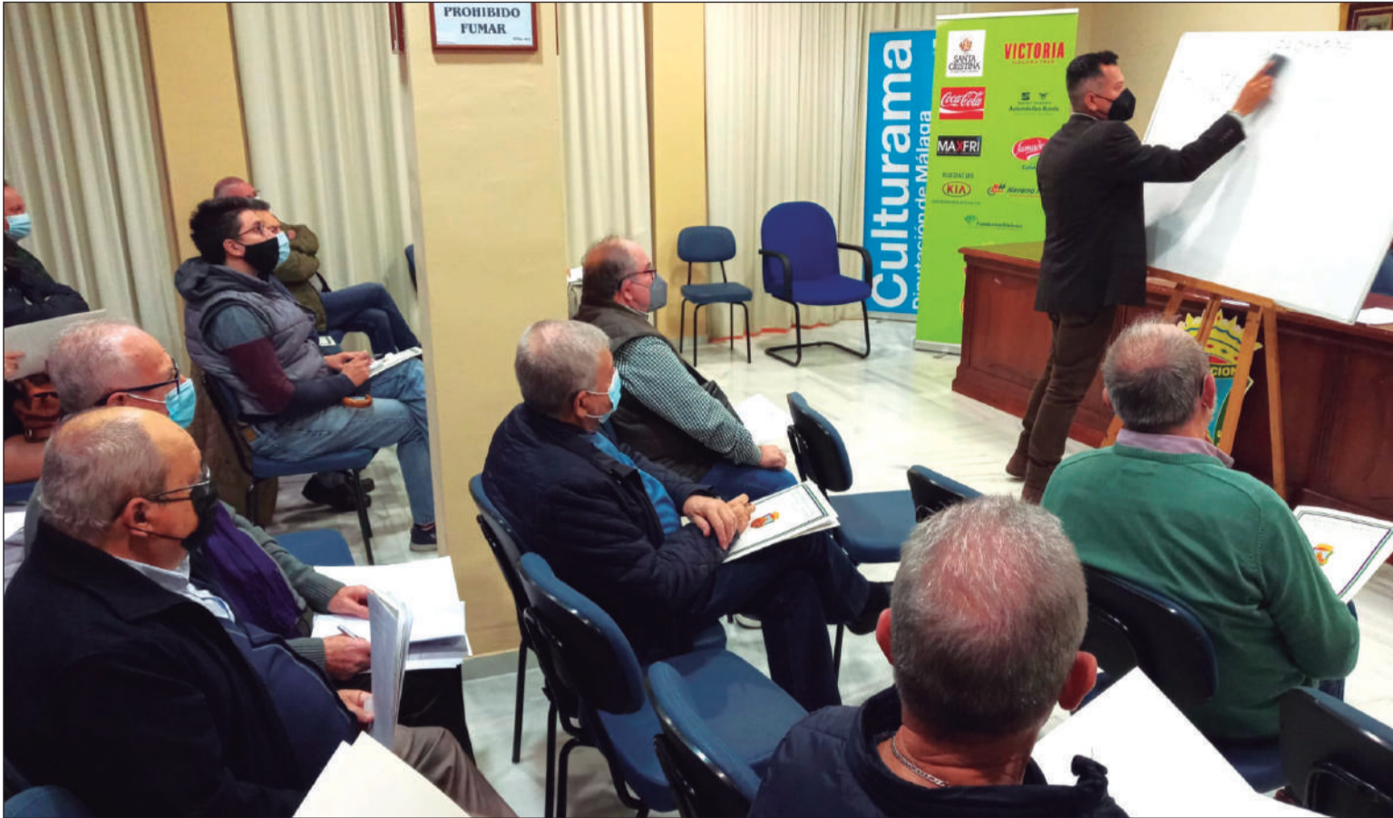
Instante del taller ofrecido en el salón de actos de la Federación Malagueña de Peñas, Centros Culturales y Casas Regionales 'La Alcazaba'.