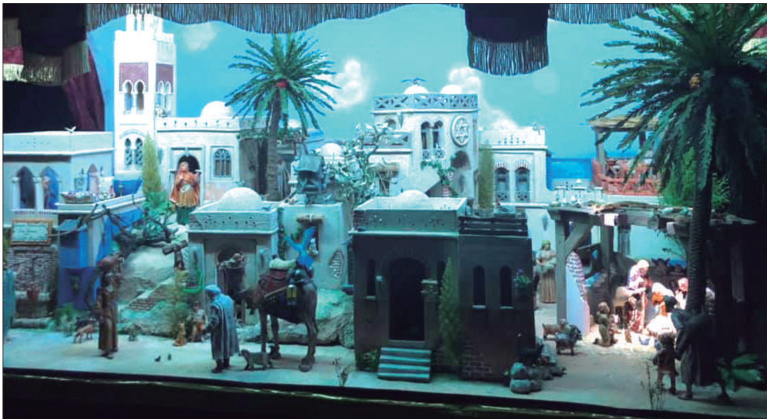
Belén de la Asociación Folclórico Cultural Juan Navarro, ganadora del primer premio en 2020 (foto) y 2021.

Cervantes, el domingo día 19 de diciembre a las 19:00 horas, coincidiendo con la final del XXIV Certamen de Pastorales, debiendo de estar todas las entidades participantes representadas.