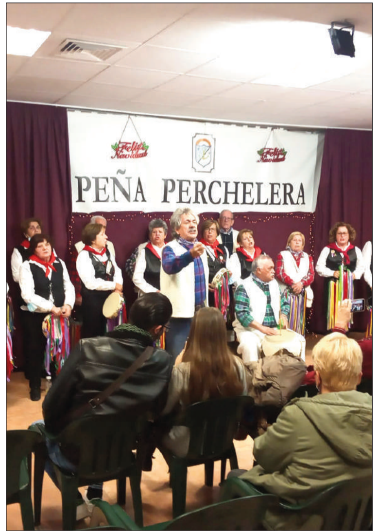
Pastoral de la Peña Montesol Las Barrancas en la Zambomba Perchelera.