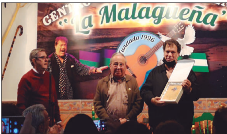
Reconocimientos en el Día del Socio.