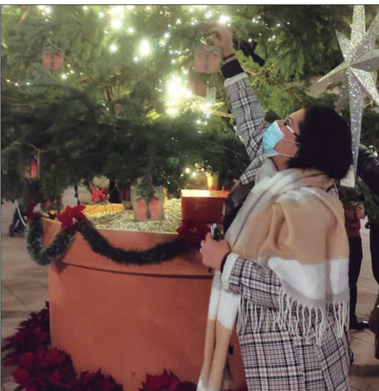
Los vecinos pudieron colgar sus deseos del árbol de la plaza del Patrocinio.