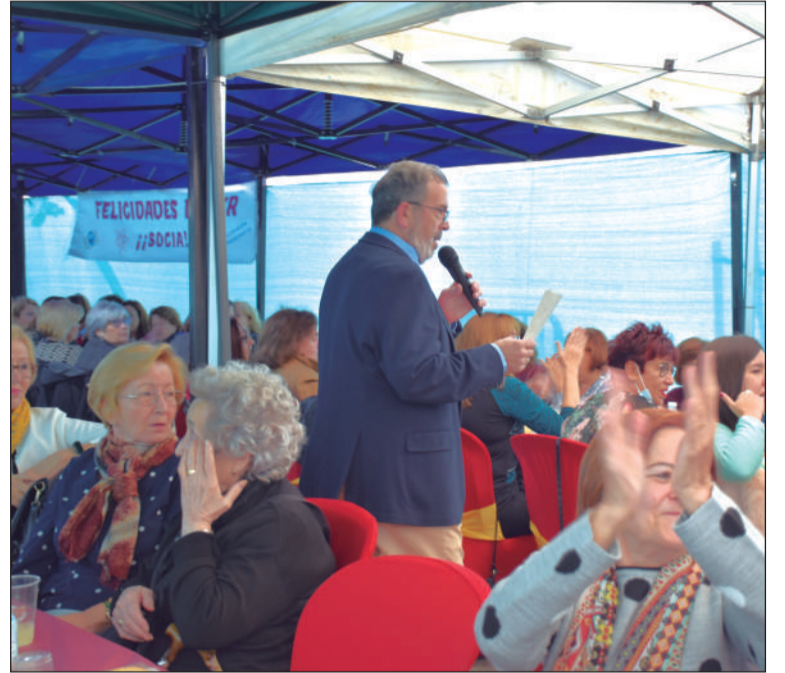
Intervención del presidente.

Se contaba con una gran afluencia de personas, que vivieron una entrañable jornada de hermandad y convivencia vecinal.