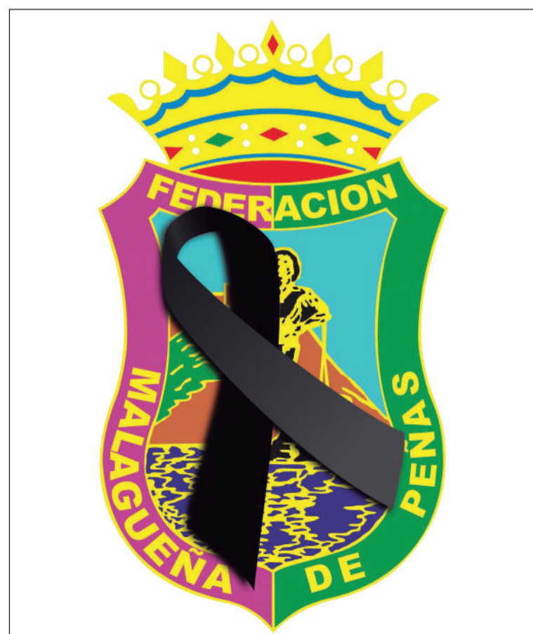
Luto en la Federación de Peñas por la defunción de su ex vicepresidenta.