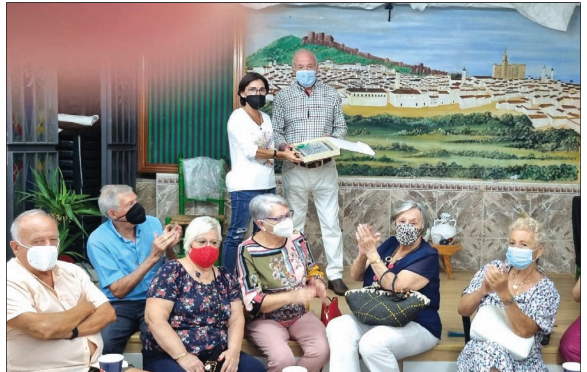
Aniversario de la Peña Nueva Málaga.