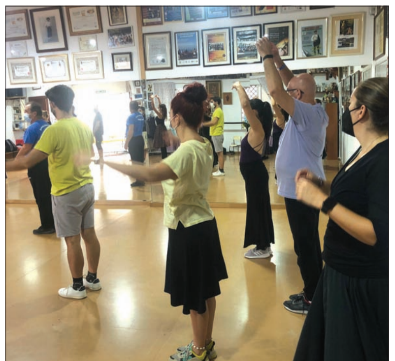
Alumnos durante uno de los ejercicios.