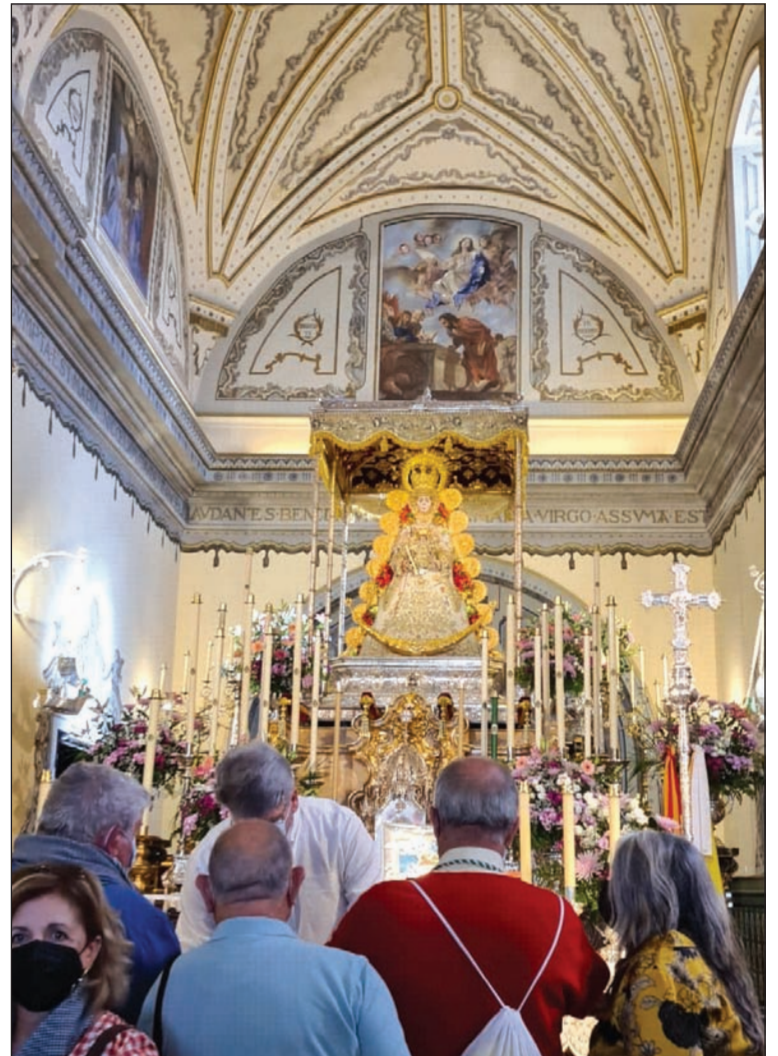
Peñistas realizan su ofrenda floral.

Atención al Peregrino se comunica que se está celebrando Año Jubilar, por lo que los que así lo quisieron pudieron alcanzar el Jubileo peregrinando ante la Virgen del Rocío, rezando por las intenciones del Santo Padre, rezando alguna oración mariana, confesando y asistiendo a Misa.