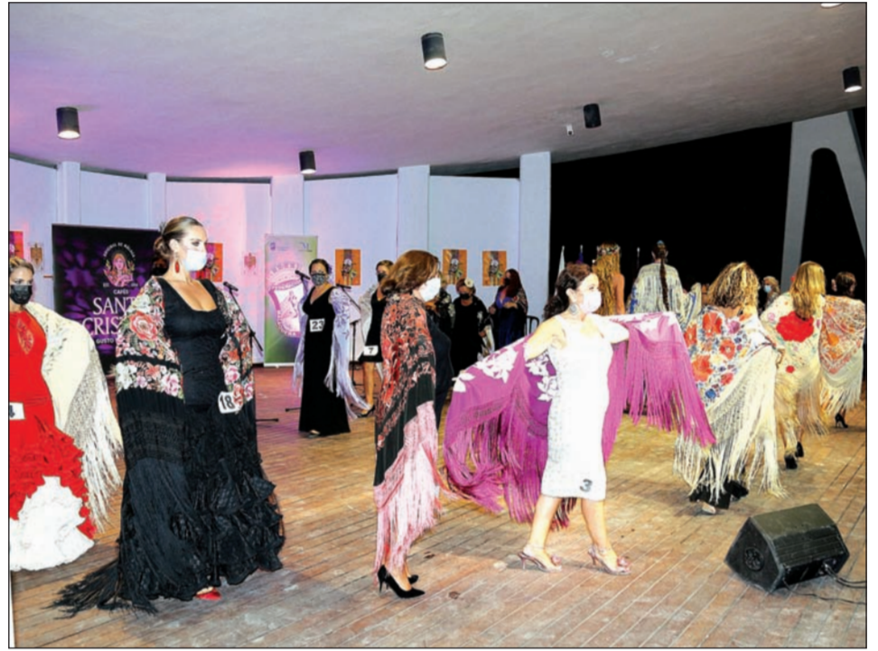
Un instante del pase de los mantones.