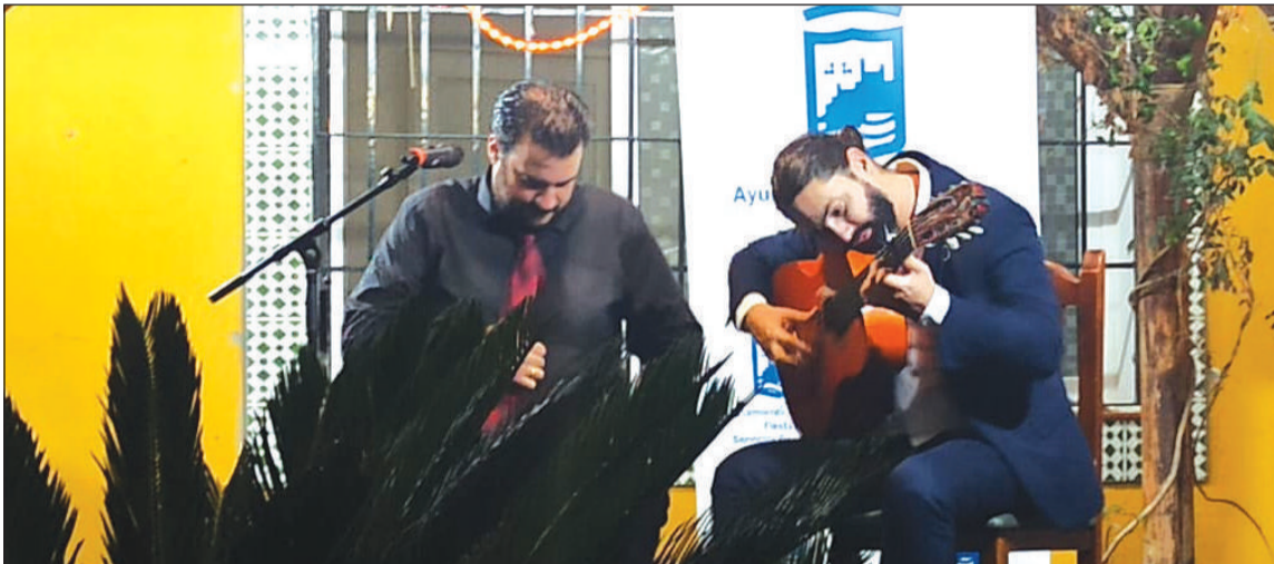
Espectáculo de ‘Siente Málaga’ en la Peña Caballista Rancho Perdido.