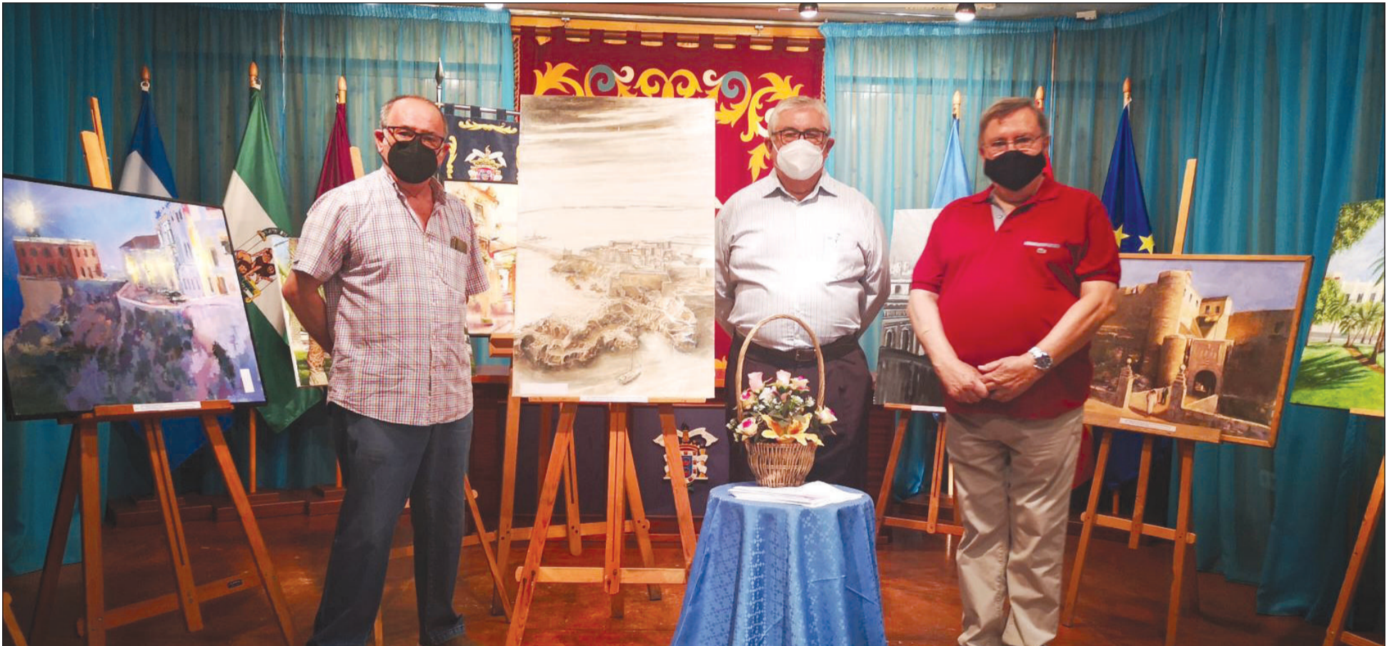
Miembros del jurado junto a la obra ganadora.

Entidades colaboradoras con esta publicación: