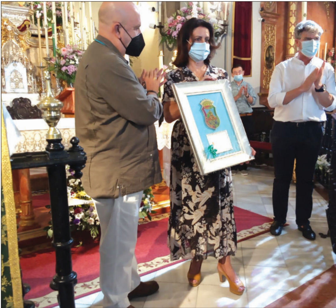
Entrega de un recuerdo a la Hermandad Matriz.