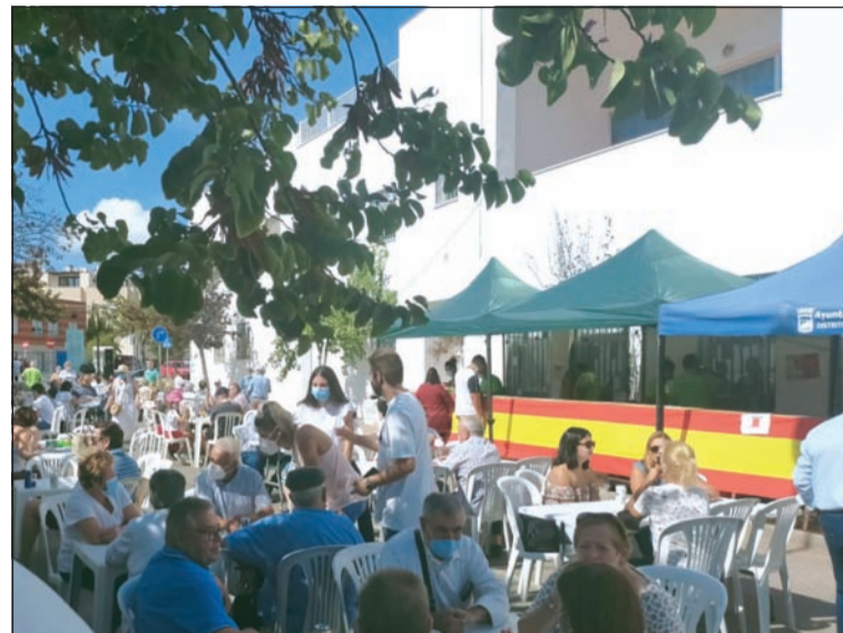
La convivencia contó con una gran afluencia de vecinos.

Ambos eventos supusieron un gran éxito de público.