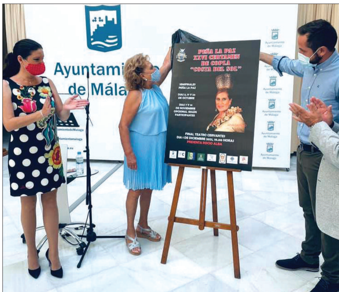
Instante en el que se descubre el cartel.