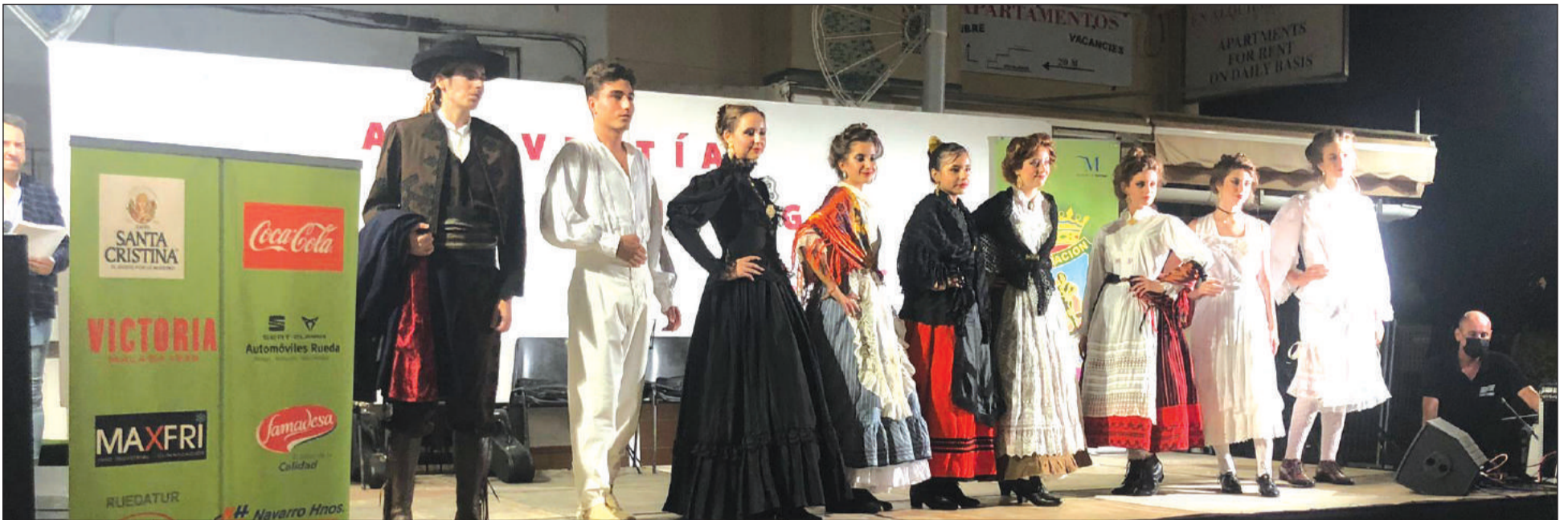
Un instante del pase celebrado en Torremolinos.