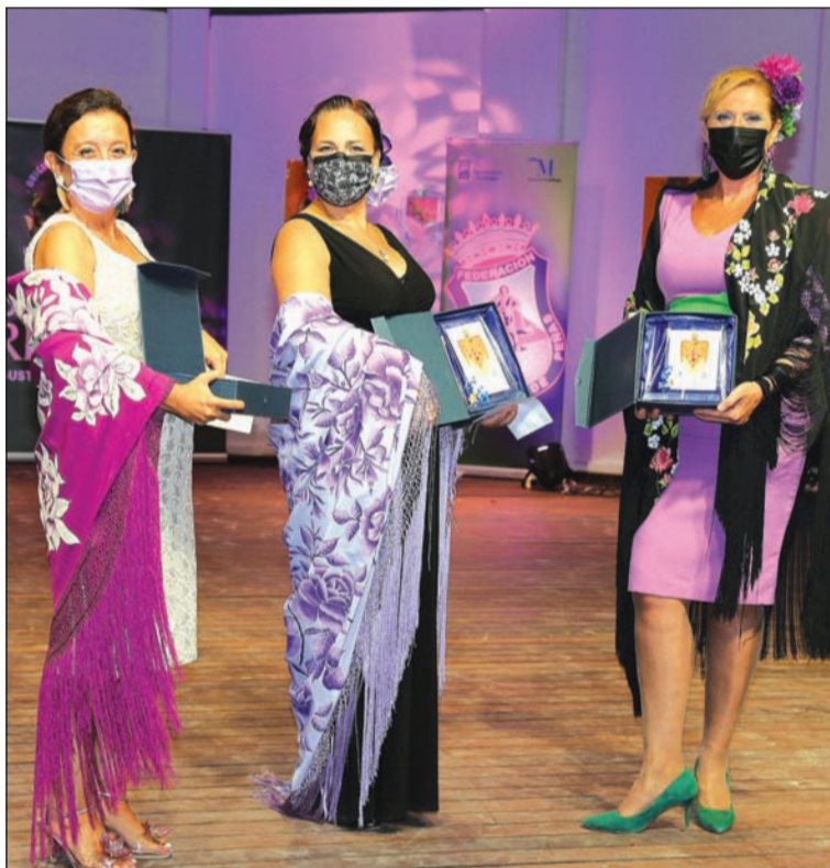
Mejores mantones pintados.