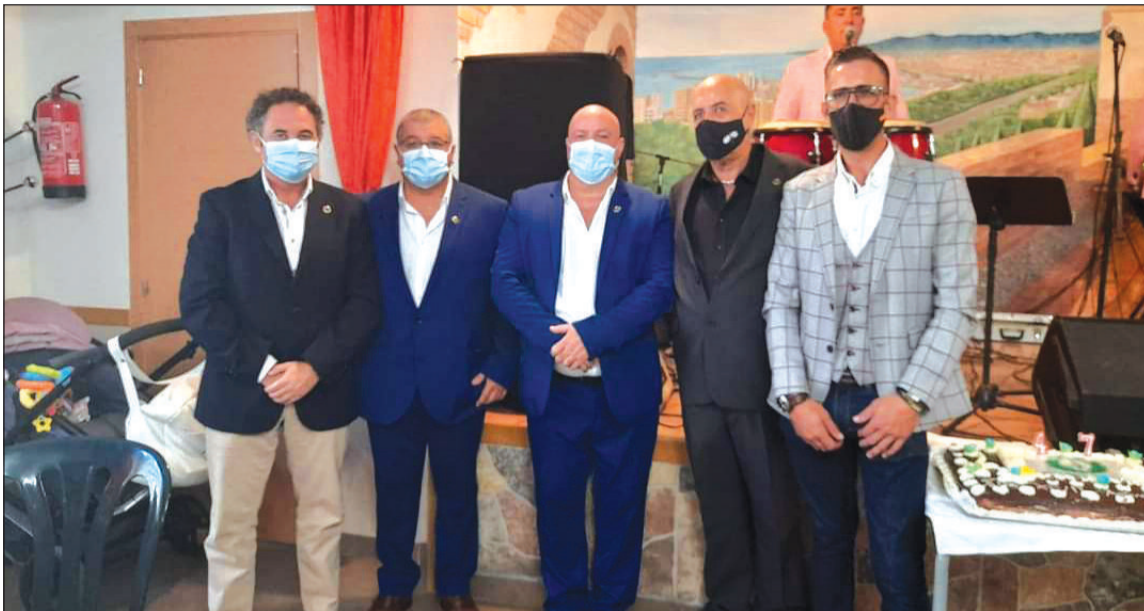
Celebración en la sede de la Peña La Biznaga.