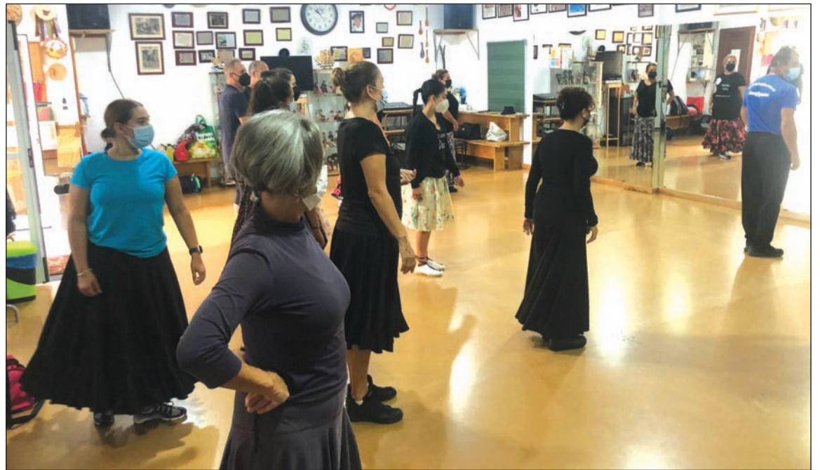
Desarrollo de una de las lecciones.

Se ha contado con una gran solicitud de inscripciones de alumnos con un Nivel Avanzado que han podido profundizar en diferentes bailes con el objetivo de mantener vivo este legado cultural.