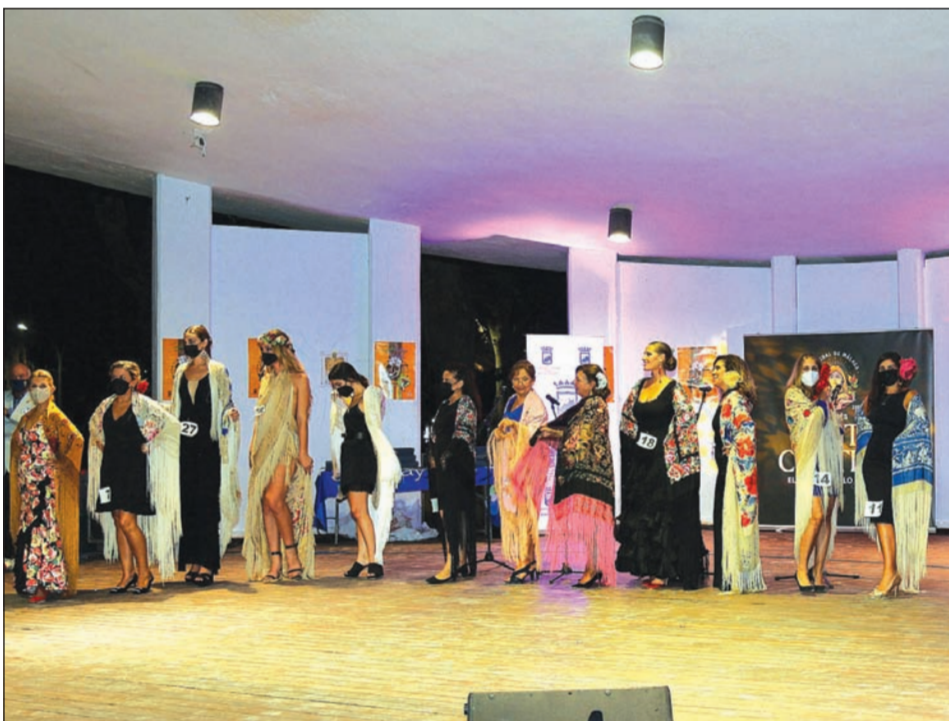
Pase de los mantones.