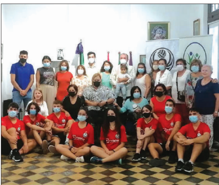
Socios con los jugadores.