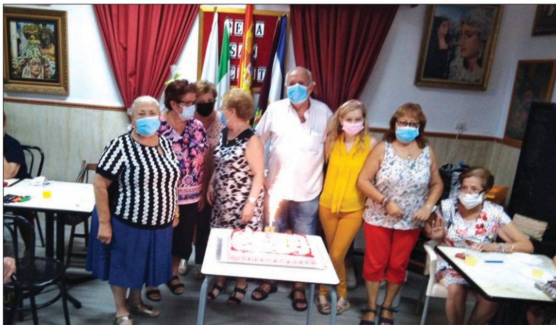
Socios celebran el centenario.

En su conjunto, fue una actividad muy emotiva ya que, pese a que se mantuvieron las medidas de seguridad, reforzó la hermandad de sus socios.