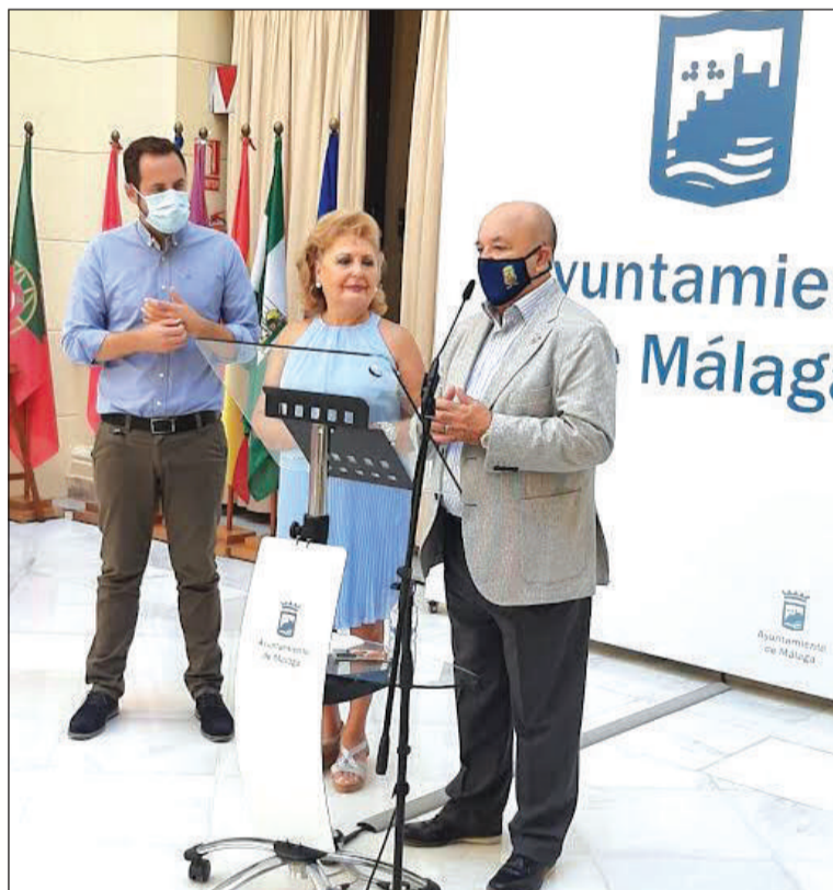
Intervención del presidente de la Federación.