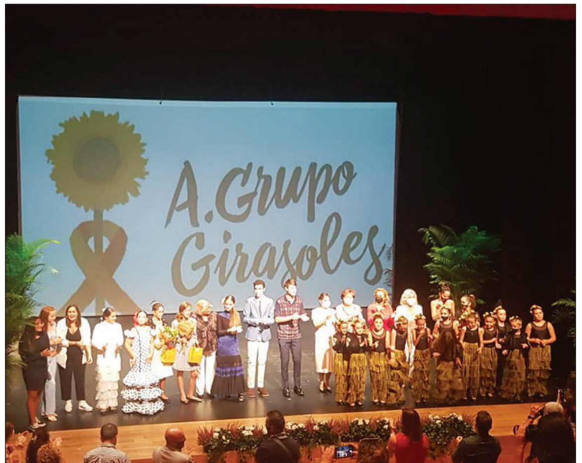
Gala celebrada en septiembre en Alhaurín El Grande.

Independientemente de los festivales hacen rastrillos, concursos gastronómicos, etc para poder atender a familias con niños con cáncer u otras enfermedades raras.