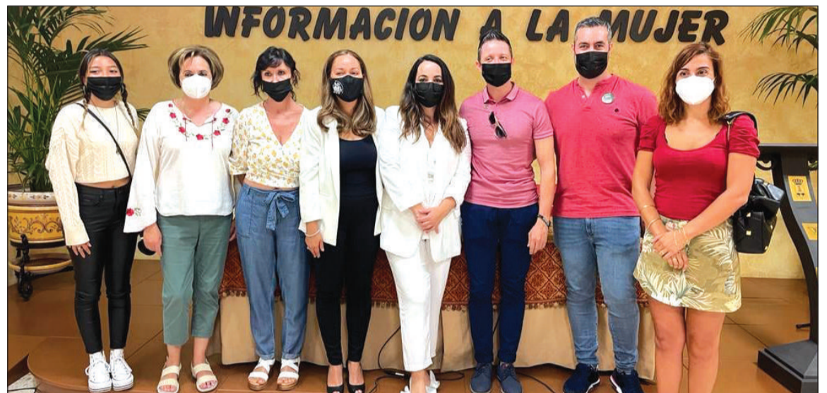
Equipo de profesionales en el Centro Municipal de Información a la Mujer de Alhaurín de la Torre.