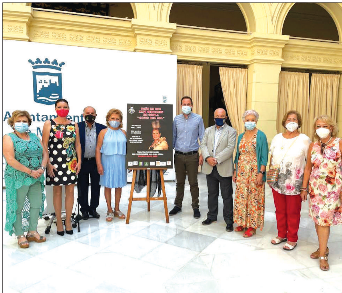
Presentación del Certamen en el Ayuntamiento.

Organizado por la Peña La Paz, colaboran en este certamen el Ayuntamiento de Málaga, la Diputación Provincial, Cafés Santa Cristina, La Canasta, Copicentro, Pepe Núñez y la Federación Malagueña de Peñas.