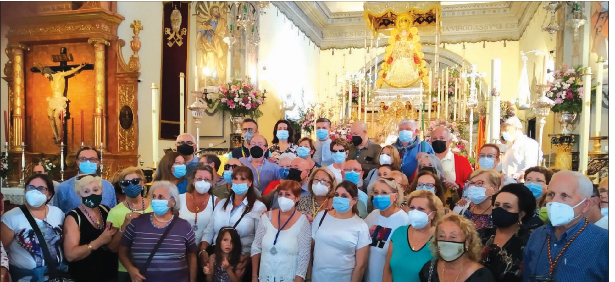
Comitiva peñista ante el altar mayor de la parroquia de Almonte.