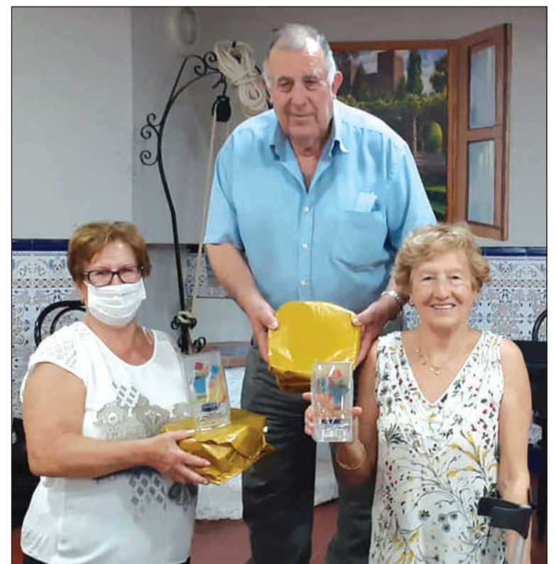
Entrega de juegos.

Todos los participantes compartieron además unas berzas para almorzar.