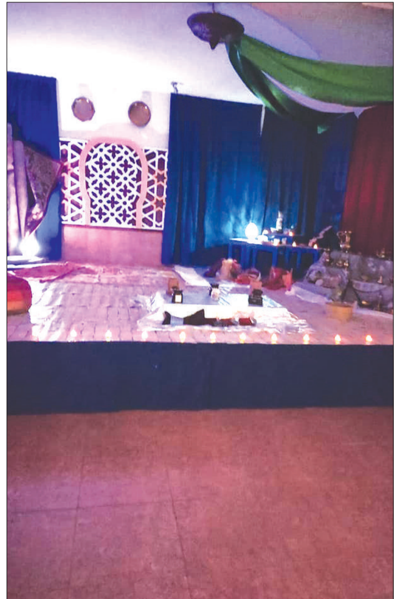
La sede se transformó en un zoco árabe.

El buen ambiente y la hermandad de todos los socios asistentes contribuyó al éxito de la actividad.