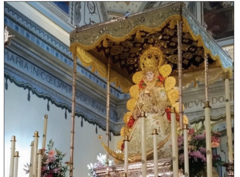
Imagen de la Virgen del Rocío, en la parroquia.

EL COLECTIVO PEÑISTA ES RECIBIDO POR LA HERMANDAD MATRIZ DEL ROCÍO