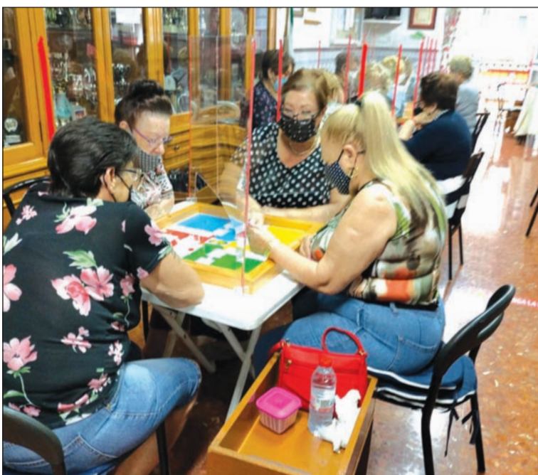
Inicio de las partidas de parchís.

Cada una de estas asociaciones presentan un equipo de dominó y otro de parchís, disputándose las partidas en sus diferentes sedes.