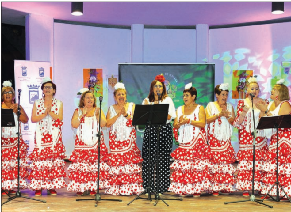
Coro Aires del Sur.