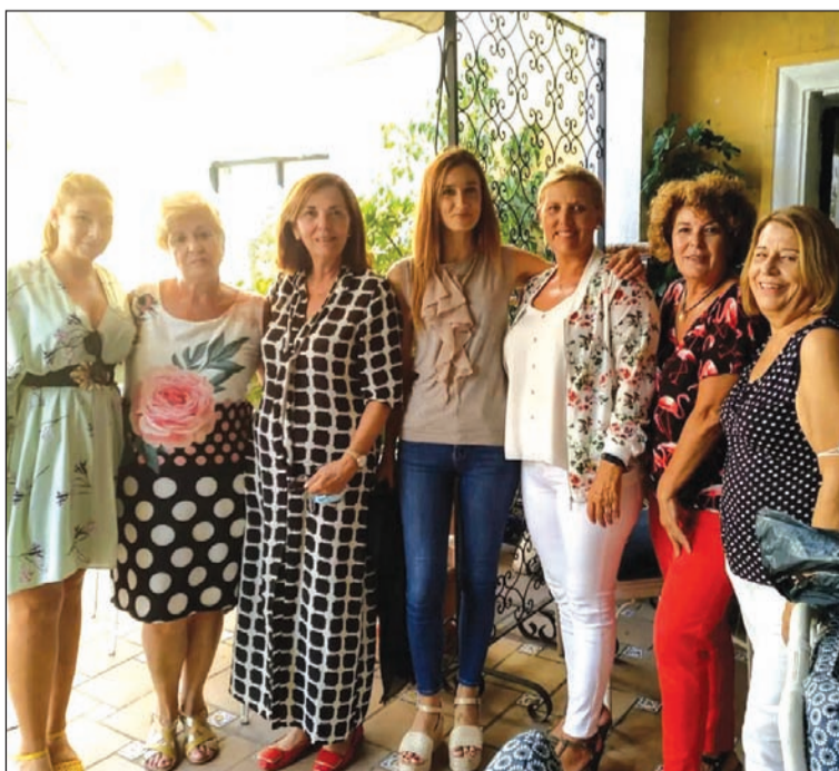
Comida de hermandad.