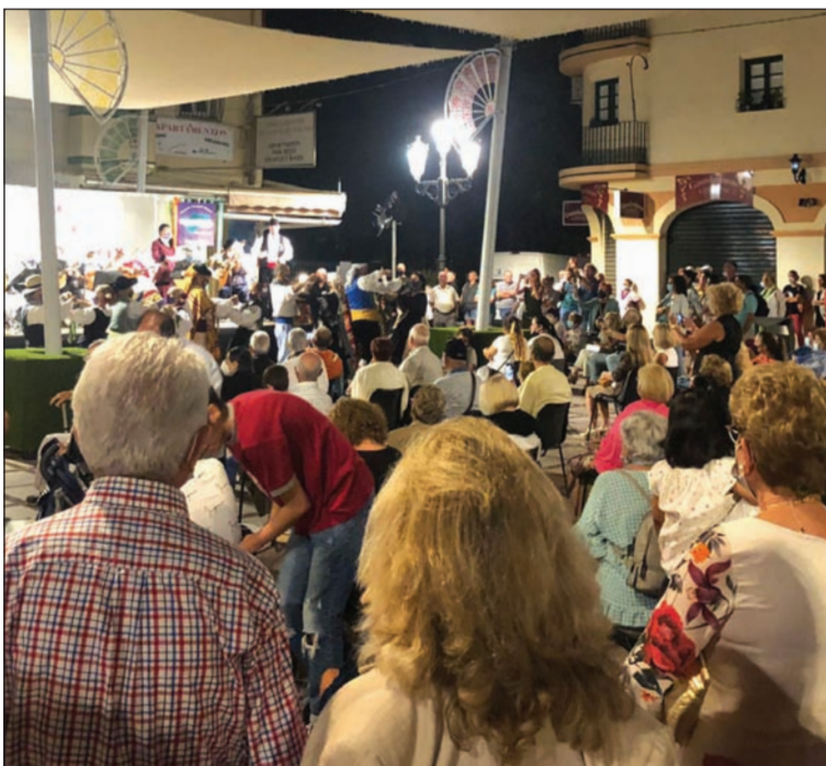
Mucho público disfrutando de la actuación de la Asociación Juan Navarro.

Esta actividad, que congregó a numeroso público, contaba con el patrocinio de la Diputación de Málaga, con la colaboración del Ayuntamiento de Torremolinos