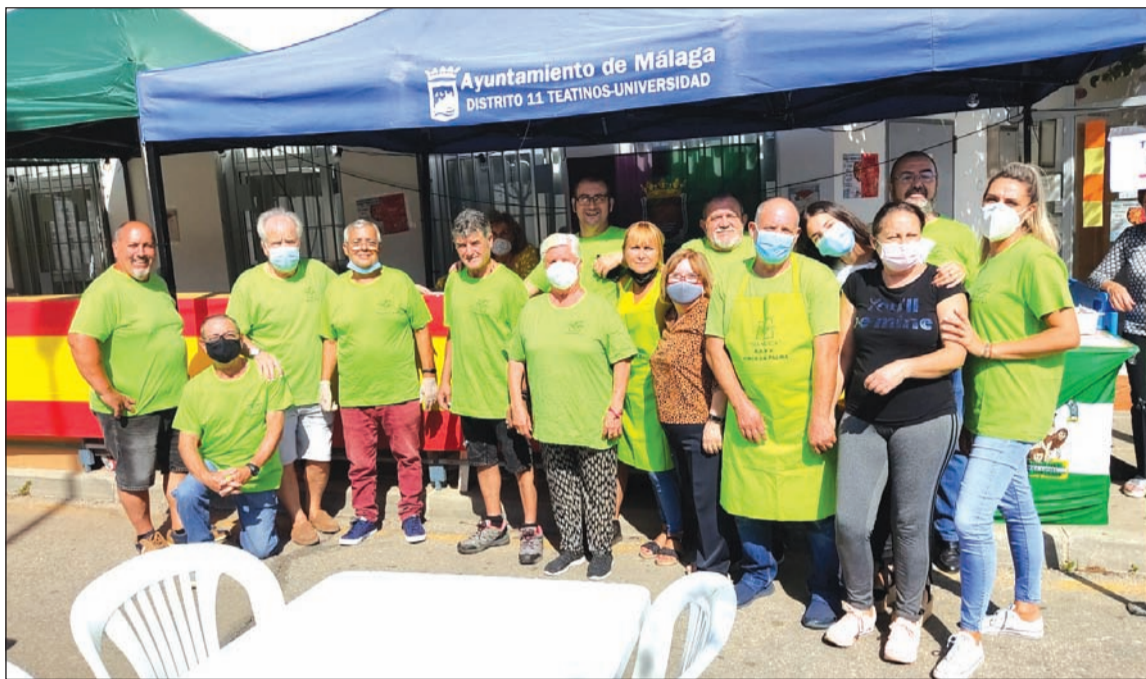
Voluntarios de la asociación de vecinos.