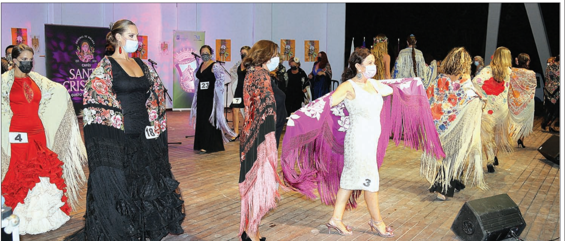
El Auditorio Eduardo Ocón acogió el regreso del Concurso de Mantones de Manila de la Federación de Peñas, celebrado el 28 de septiembre con el patrocinio de Cafés Santa Cristina.

Durante dos días, los peñistas han podido conocer todo el entorno de la Aldea y sus tradiciones pasando unos días muy emotivos. En total han sido 108 los socios de entidades federadas que han podido asistir, completando todas las plazas disponibles.