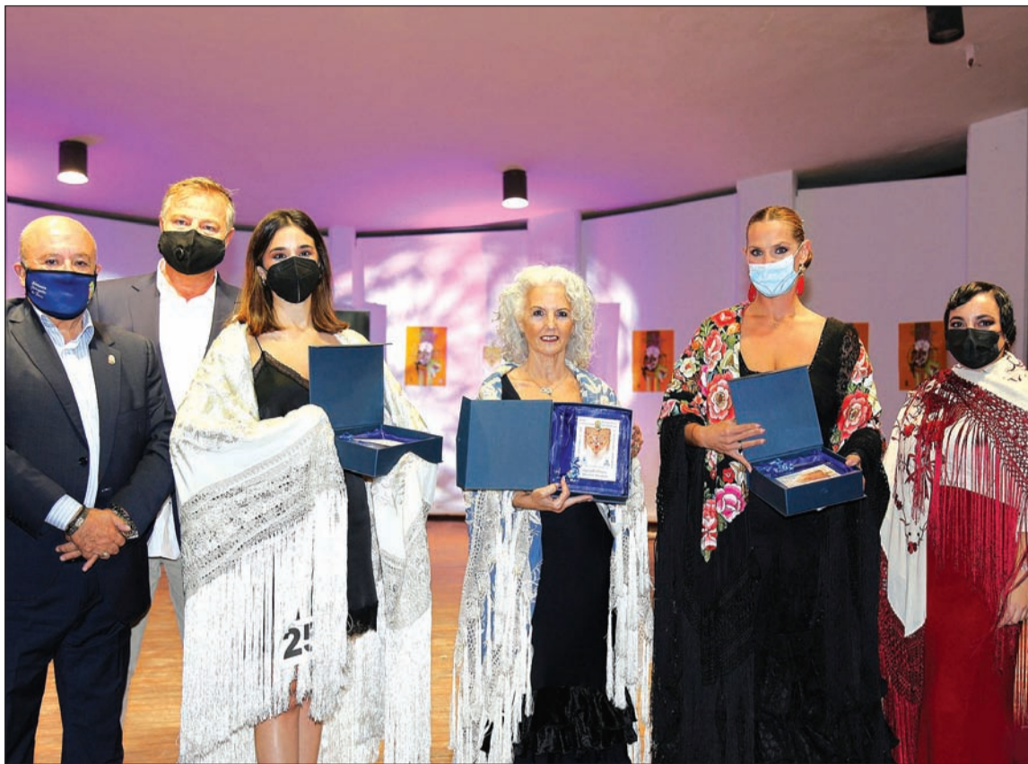
Mejores mantones bordados.