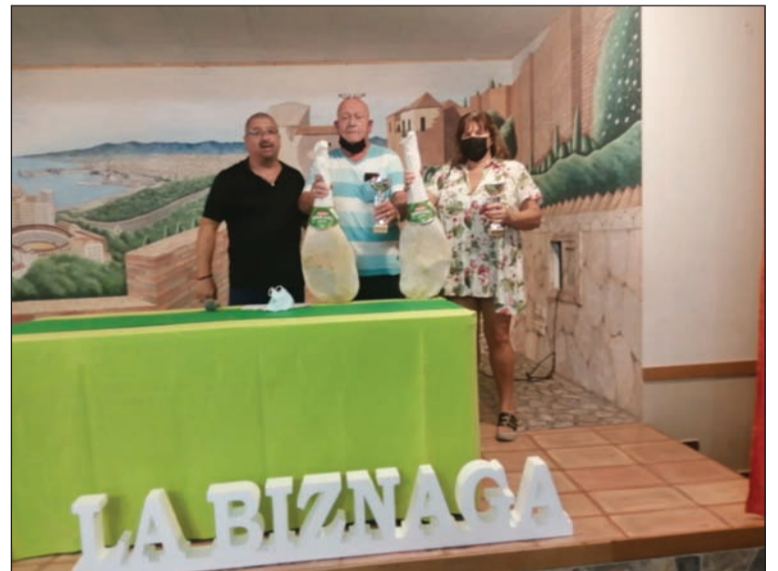
Entrega de premios del Torneo de Parchís.