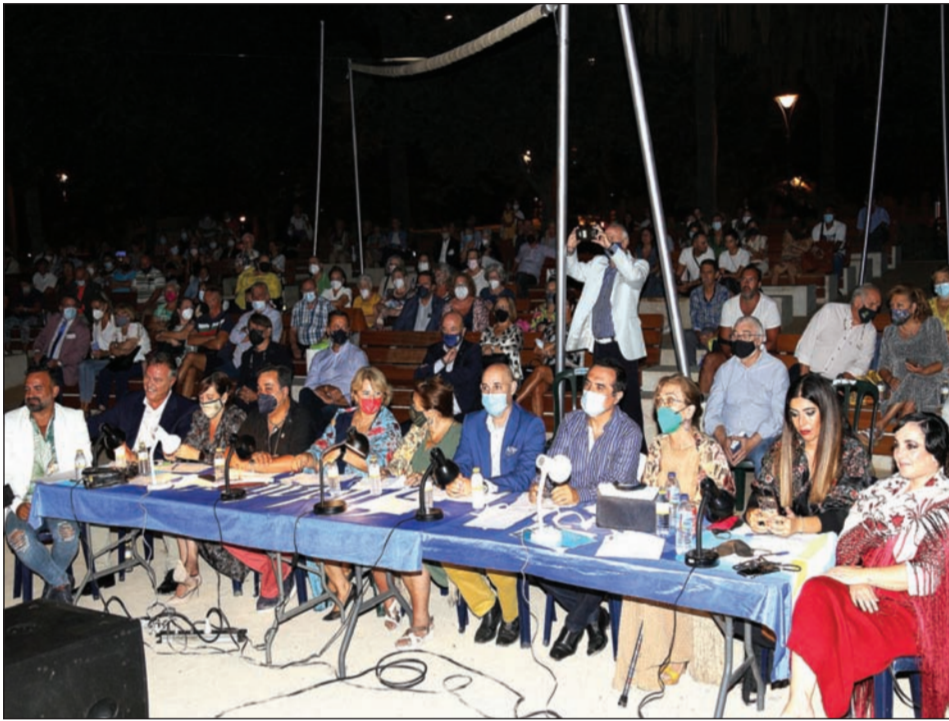
Componentes del jurado.