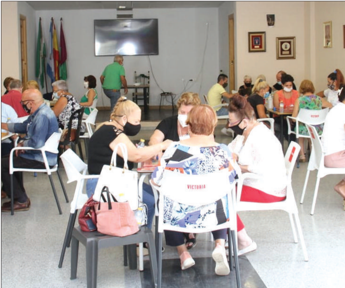
Desarrollo de la competición de parchís en su edición de 2020 en la Peña Tiro Pichón.