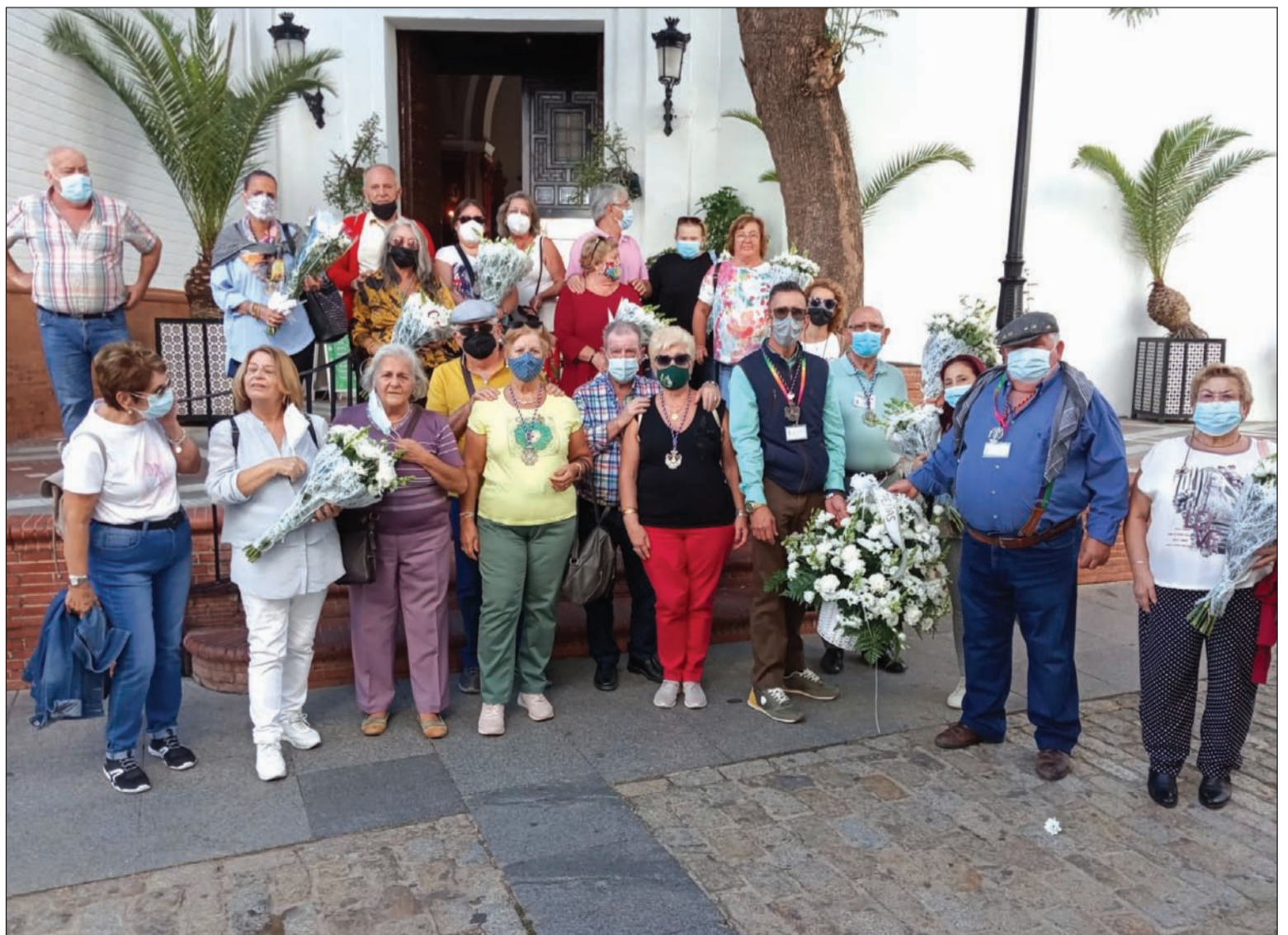
Representantes de algunas de las entidades participantes antes de realizar la ofrenda floral a la Blanca Paloma.

Ya el día 9, tras el desayuno en el hotel, se realizaba una visita a la Aldea del Rocío; antes de partir hasta Bollulos Par del Condado, donde se servía una comida consistente en paella de marisco y mariscada individual. A continuación se regresaba a Málaga con la satisfacción de disfrutar de dos días inolvidables.