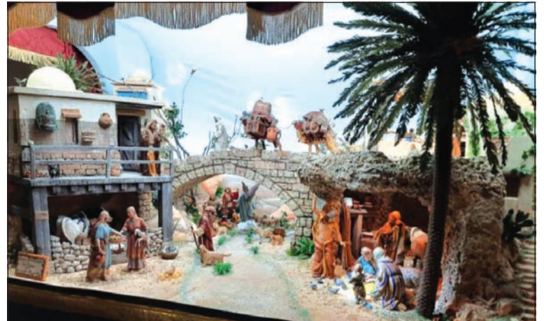
Belén de la Asociación Juan Navarro, primer premio en 2020.

Con tal motivo, se solicita información del lugar de instalación de los Belenes y su horario de visita; que deberá ser comunicado antes del 22 de noviembre.