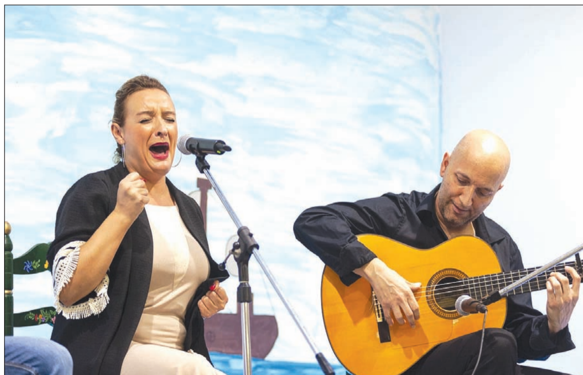
Un instante del recital flamenco en la sede de la Peña Finca La Palma.

De este modo, se ponía fin a este ciclo que ha contado con una importante participación por parte de los socios de las entidades federadas y de aficionados en general.