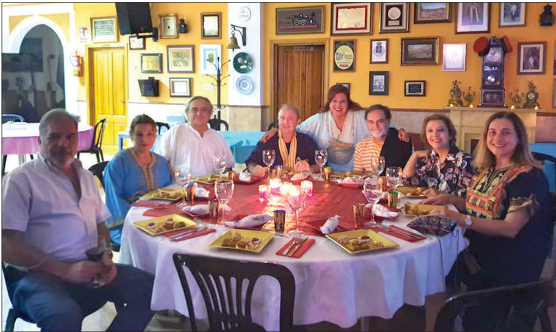
Socios disfrutaban de una velada a la luz de las velas.