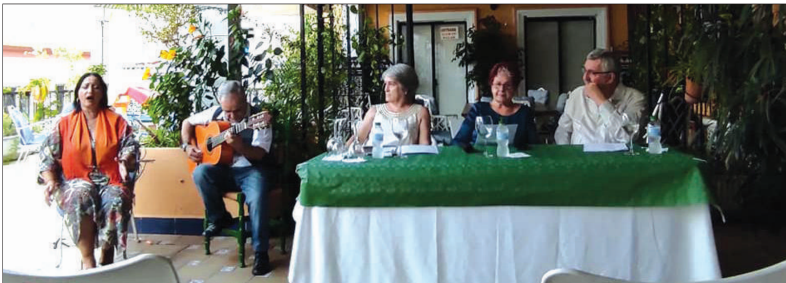
Un instante del recital poético.