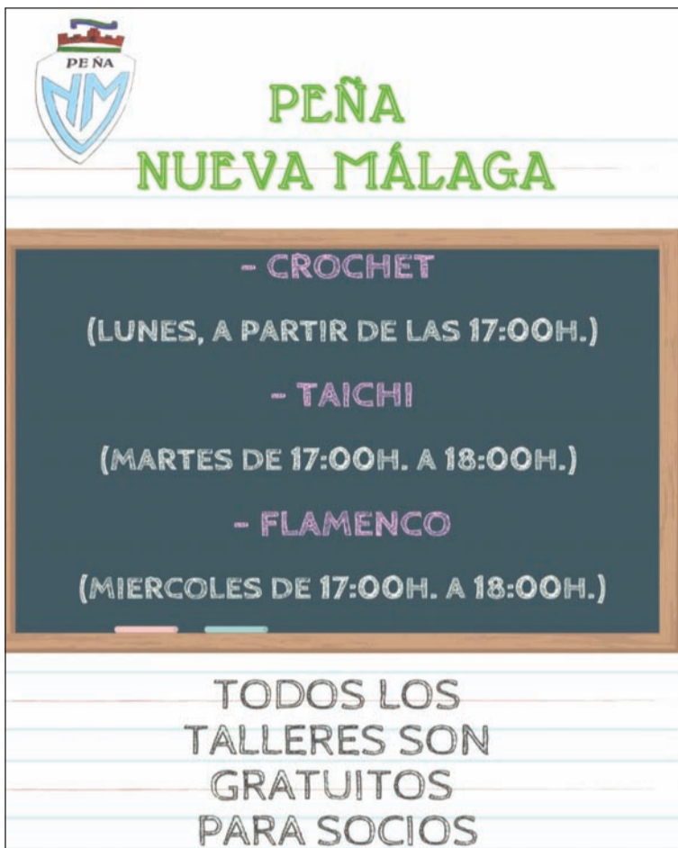
Cartel con los talleres que se han retomado en octubre.