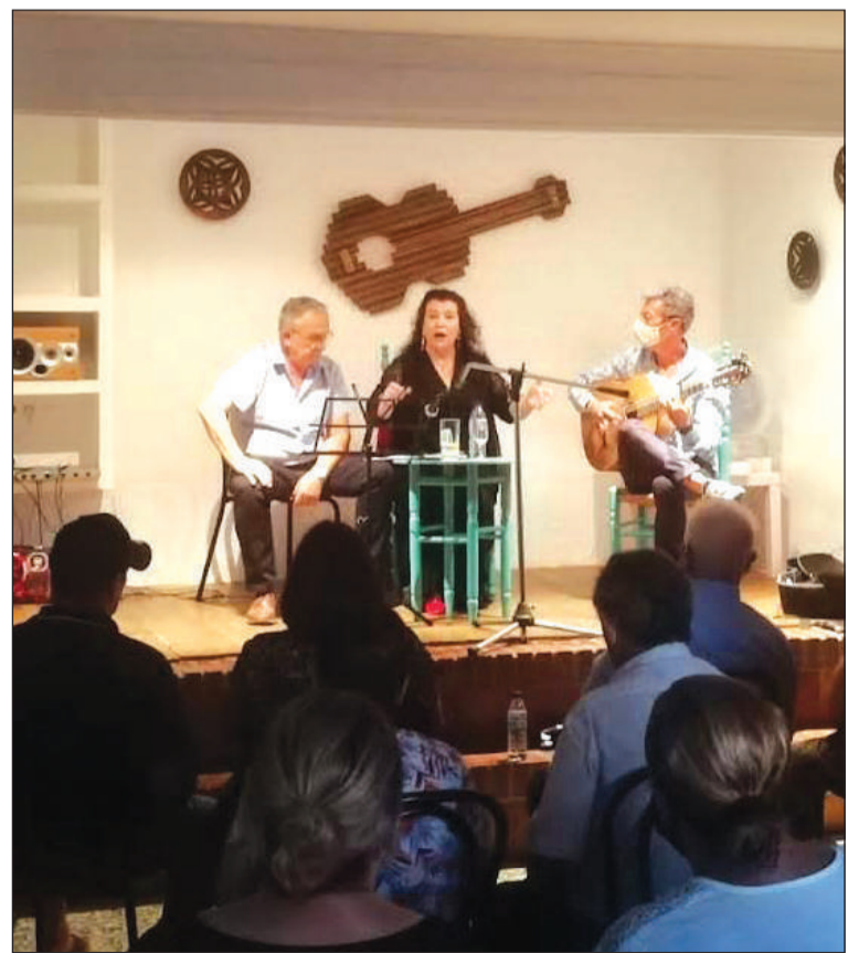
Conferencia en la Peña Cortijillo Bazán con la que se inauguraba el ciclo.

Todos estos actos darán inicio a las 20 horas, con entrada libre hasta completar el aforo.