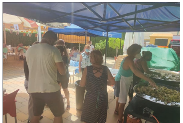
Peña Colonia Santa Inés.