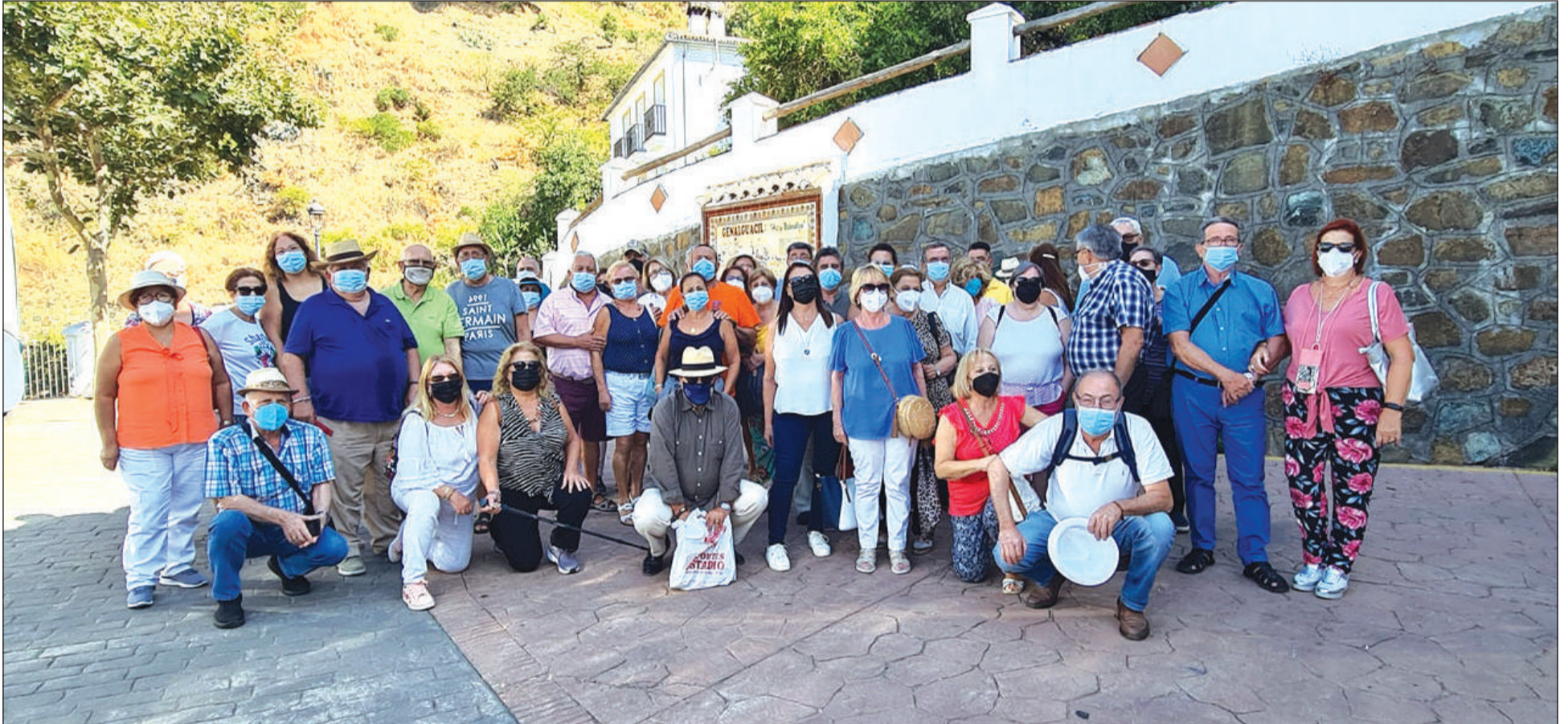
Grupo de peñistas a la llegada a la localidad de Genalguacil.

Entidades colaboradoras con esta publicación: