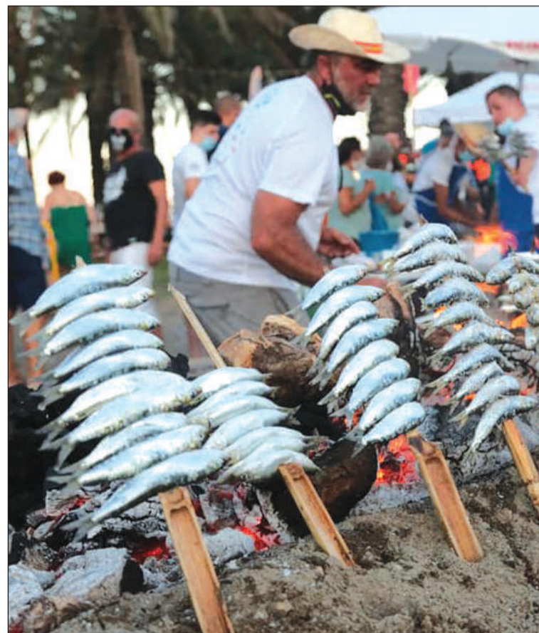
Un instante del concurso.