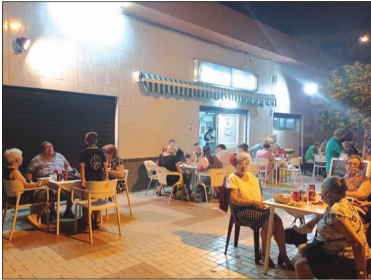
Peña Er Salero.

La ilusión de todos los peñistas, al igual que la de todos los malagueños, es recuperar la Feria en 2022.