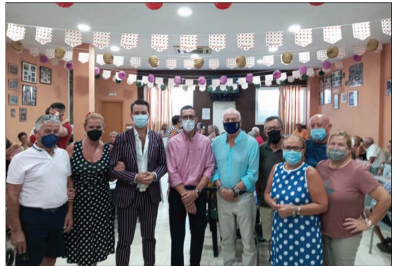
Peña Santa Cristina.