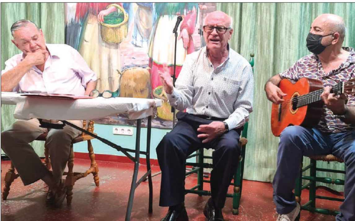
Flamenco en la Peña Recreativa Trinitaria.