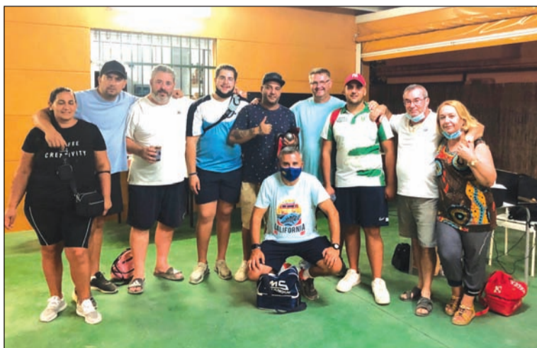
Participantes en la mele del pasado mes de julio.