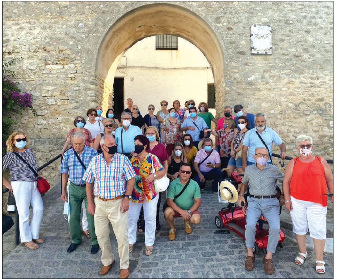
Imagen de grupo de componentes de la asociación.