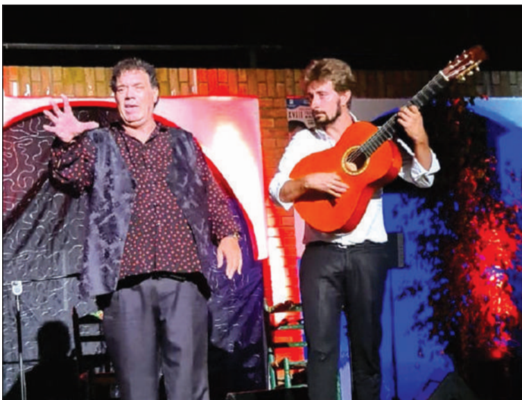
Chato de Málaga, en un momento de su actuación.