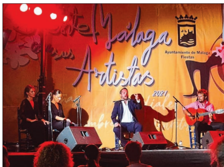
Una de las actuaciones desarrolladas en las sedes peñistas.

La Federación Malagueña de Peñas participa en 'Siente Málaga', un festival de música con raíces autóctonas dividido en cinco secciones organizado por el Área de Fiestas. Las sedes de las entidades acogen las actuaciones en los distritos.