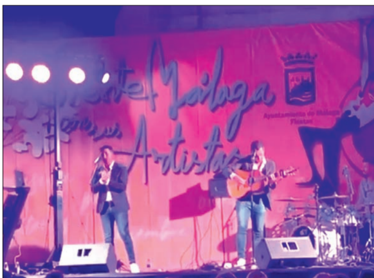
Hermanos Ortigosa en la plaza del Patrocinio.