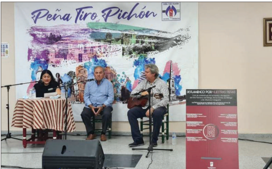
Sesión celebrada en la sede de la Peña Tiro Pichón.