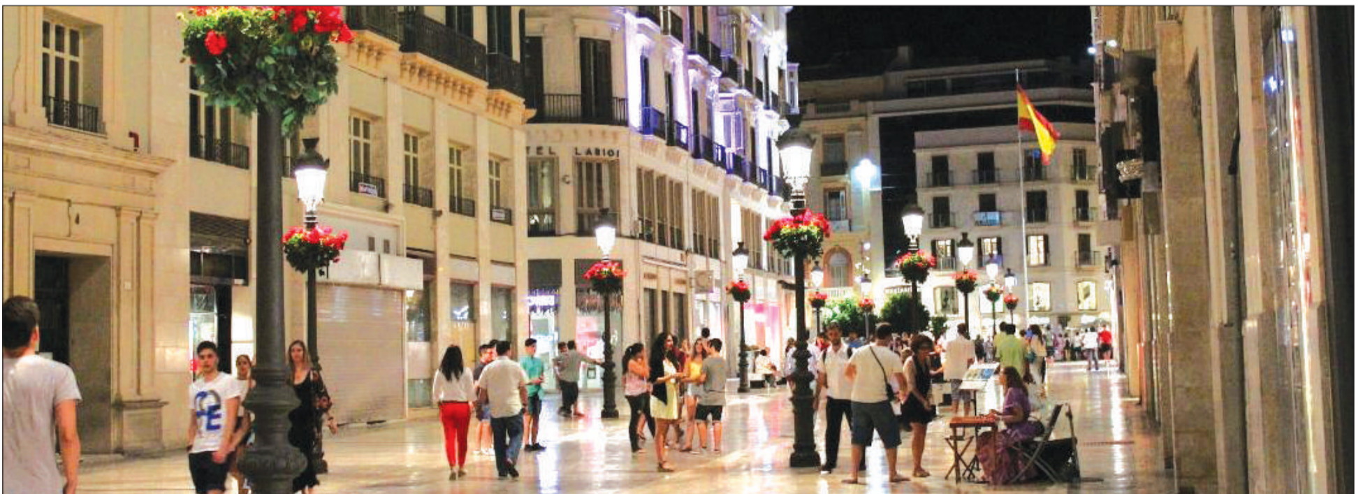
Vista nocturna de la calle Larios, epicentro de la Ciudad de Málaga.