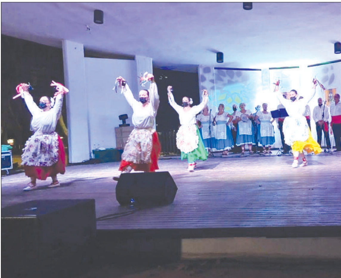
Una de las actuaciones del FIFMA 2021.