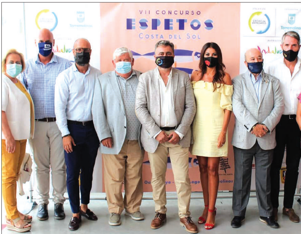
Representantes de la Federación junto a autoridades, organizadores y patrocinadores.