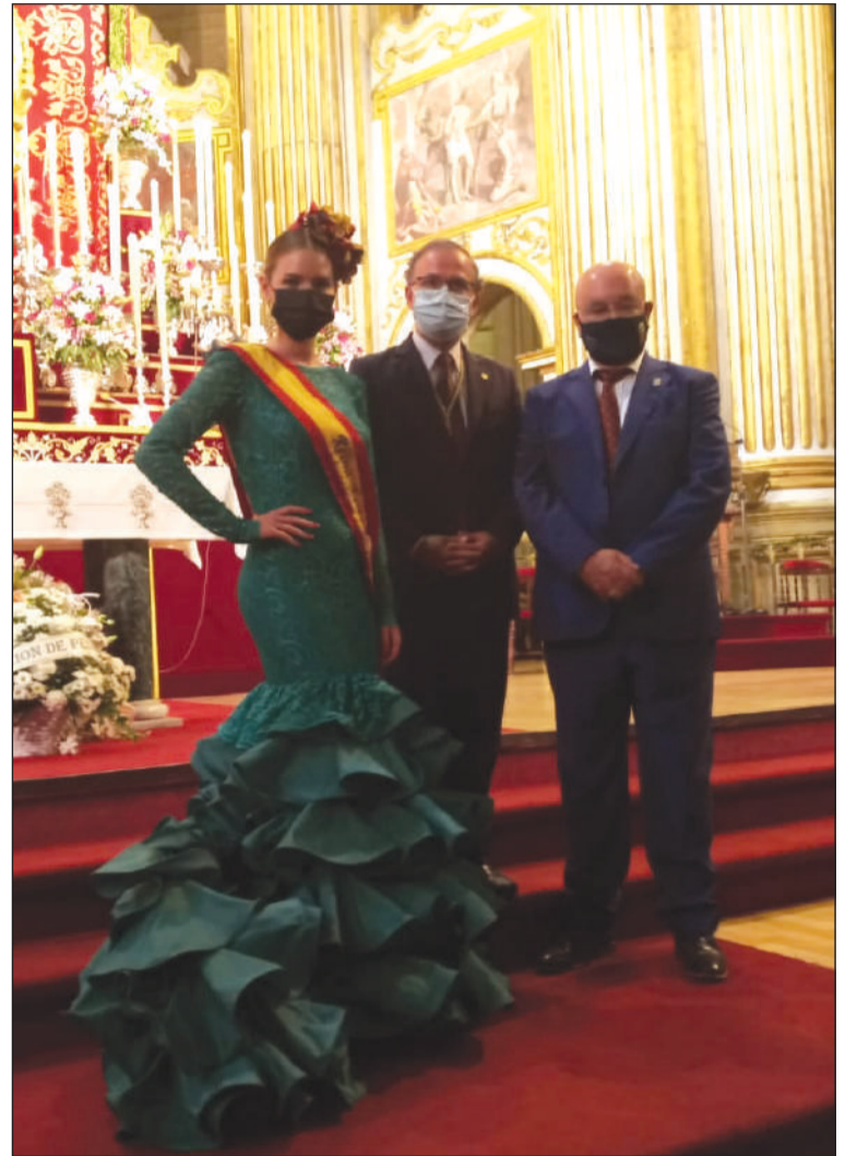
La Reina de la Feria de 2019, con el presidente peñista y el hermano mayor.

El sábado 11, con motivo del regreso de la patrona a su Santuario, la sede peñista fue engalanada.