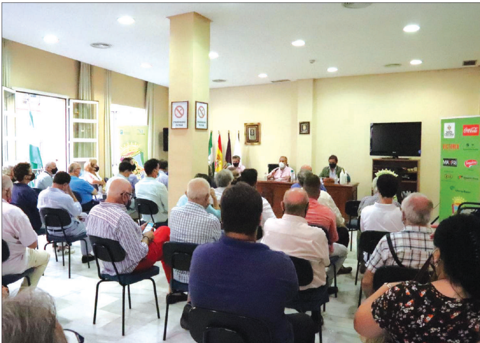
Aficionados y peñistas respondieron de forma masiva a la propuesta de la Federación Malagueña de Peñas para hablar de toros.