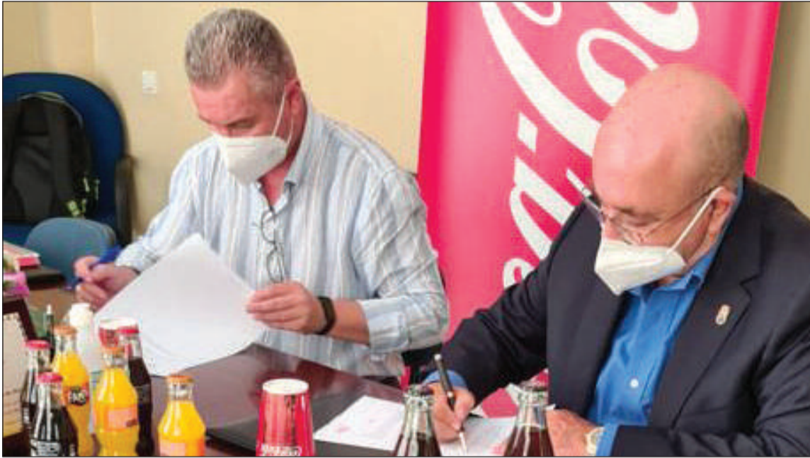
Momento de la firma del convenio en la sede de la Federación Malagueña de Peñas.