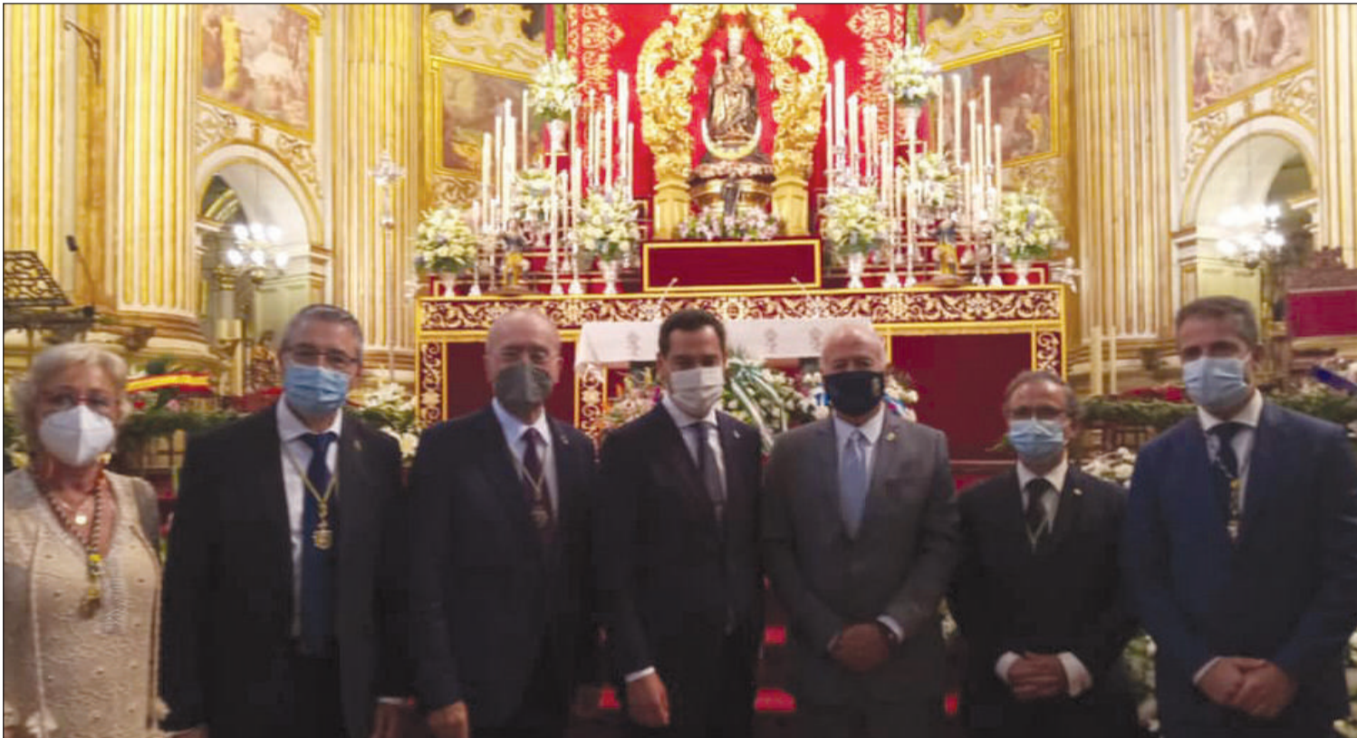
El colectivo peñista ha participado en los diferentes actos celebrados con motivo de la festividad de Santa María de la Victoria, Patrona de Málaga.

Número 731 15 de Septiembre de 2021 C/ Pedro Molina, 1 Tfno: 952 22 54 39 Fax: 952 21 48 82 E-mail: prensa@femape.com Web: www.femape.com Edición digital: www.femape.com/laalcazabadigital Twitter: @FMPLaAlcazaba Facebook: www.facebook.com/FMPLaAlcazaba