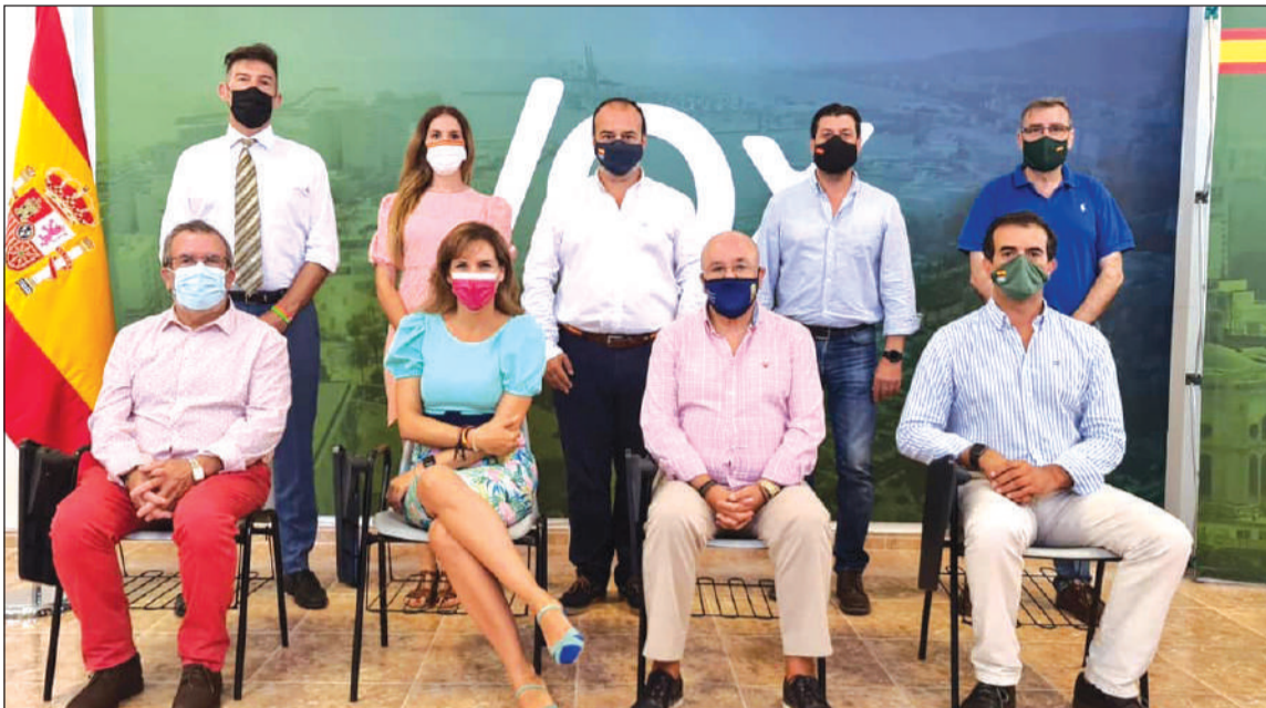
Componentes de la Federación de Peñas con representantes de VOX en Málaga.