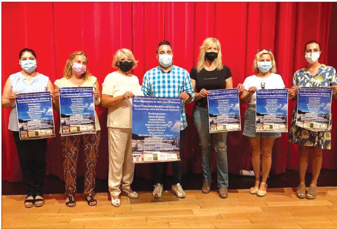
Miembros de la asociación, durante la presentación del festival en Alhaurín El Grande.