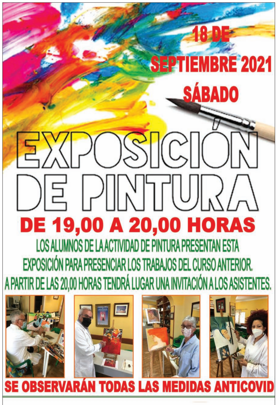
Cartel de la exposición de pintura.

Y como adelanto al mes de octubre, el día 3 se comenzará con las habituales comidas de los domingos. Para ello y como inauguración, se elaborará un menú a base de ensalada, arroz y postre, ofrecido gratuitamente a los socios.