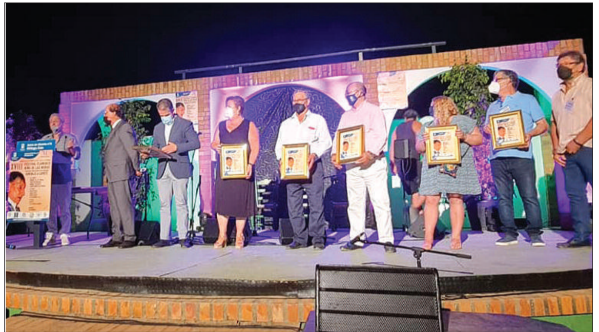
Entrega de recuerdos a los participantes en el Festival.