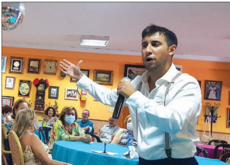
Un instante de la actuación.

Como antesala al comienzo de estos talleres, cuyo plazo de inscripción permanece abierto, desde esta entidad perteneciente a la Federación Malagueña de Peñas, Centros Culturales y Casas Regionales 'La Alcazaba' se convocaba a los socios a una comida de hermandad en la que se contaba con una actuación musical en directo.