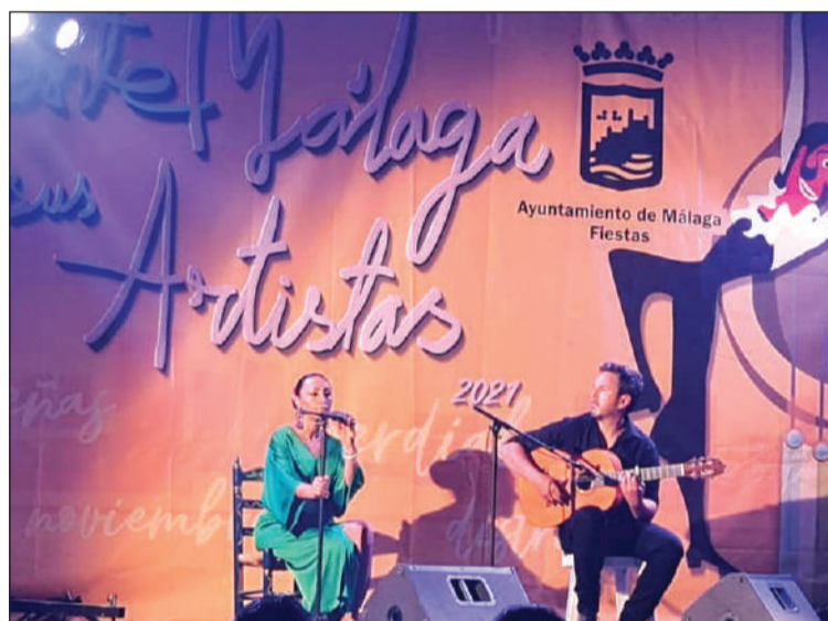
Siente Málaga en la Peña Finca La Palma.

Los verdiales, la conmemoración del Día internacional del Flamenco y unos paseos teatralizados por la historia de la Feria de Málaga completan esta programación.