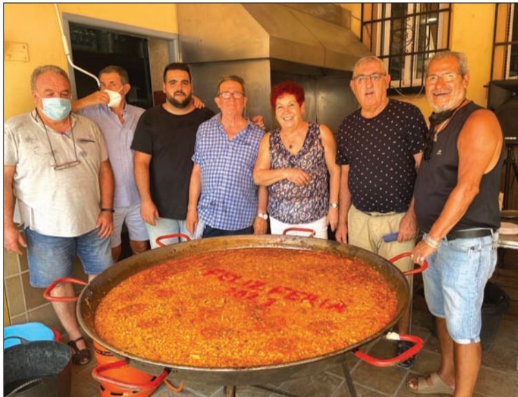
Casa de Álora Gibralfaro.