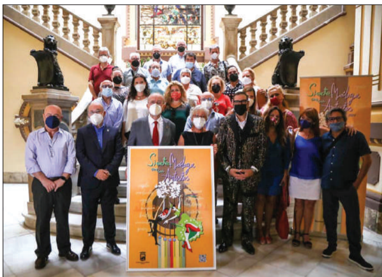
Presentación de este programa.