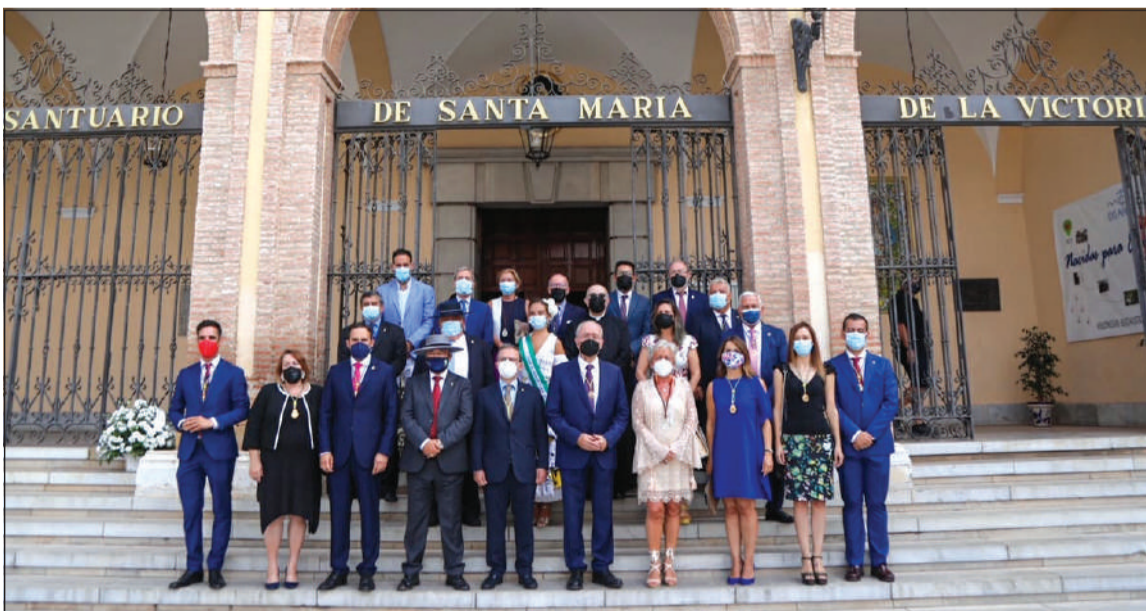
Comitiva que se desplazaba al Santuario con motivo de la ofrenda floral de inicio de Feria.