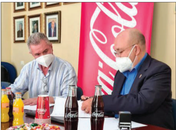
FIFMA 2021 se celebraba en el Auditorio Eduardo Ocón.

La Federación Malagueña de Peñas, Centros Culturales y Casas Regionales 'La Alcazaba' ha alcanzado un acuerdo con Coca-Cola European Partners para que continúe como patrocinador del colectivo.