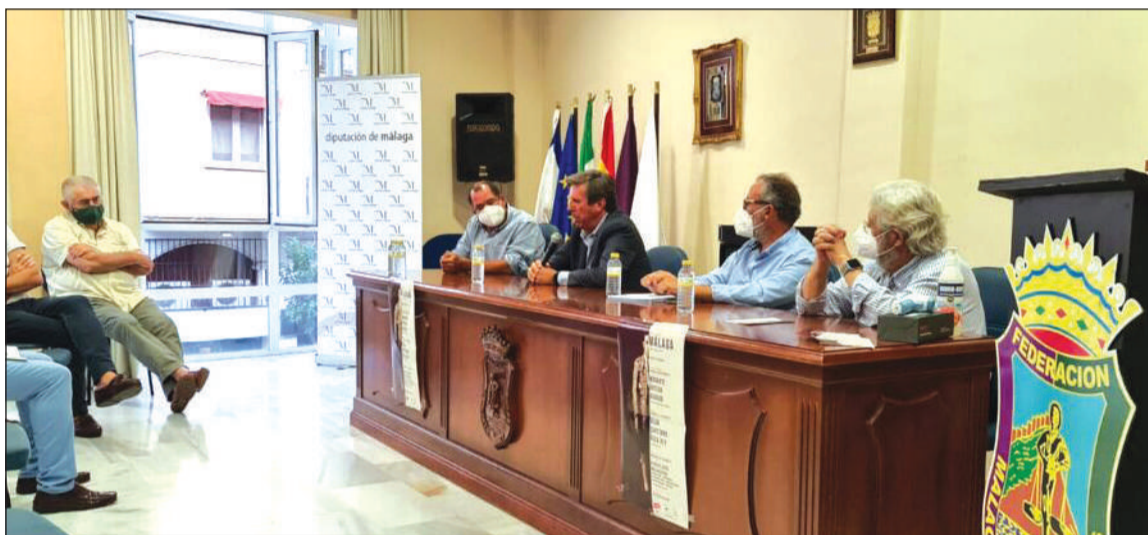
Desarrollo de la segunda tertulia taurina, con balance de lo acontecido en el ruedo de La Malagueta.