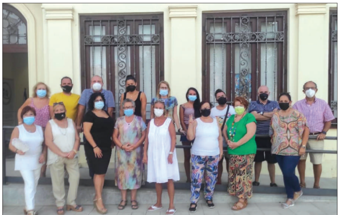
Monitores de los diferentes talleres que se imparten.