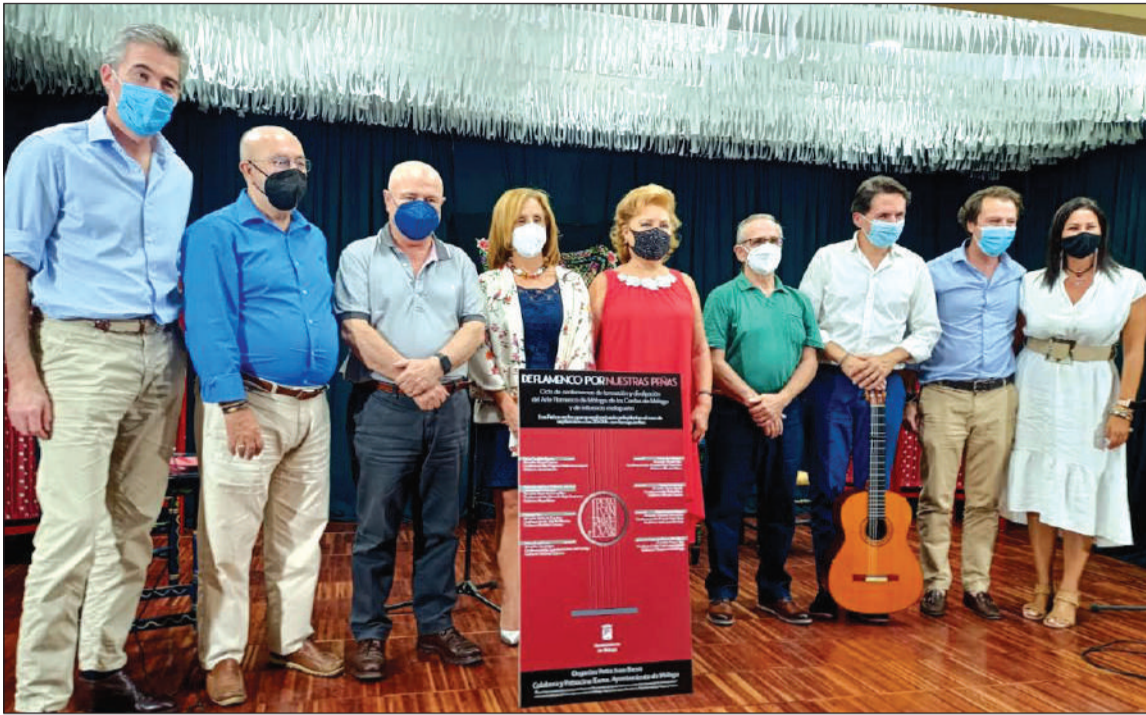
Asistentes a la conferencia en la Peña La Paz.