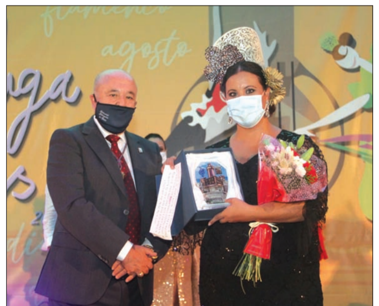
Trofeo entregado por el presidente de la Federación de Peñas.