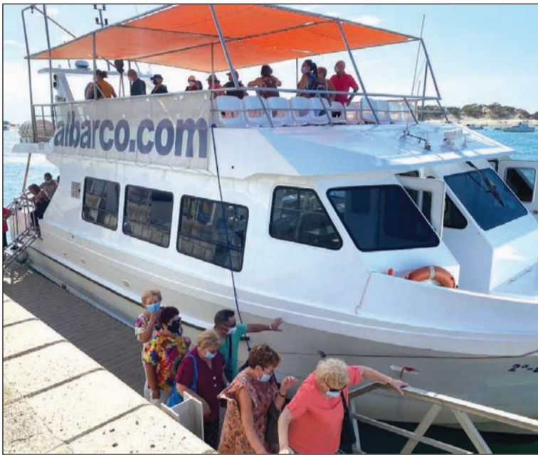
Los socios desembarcan del catamarán.