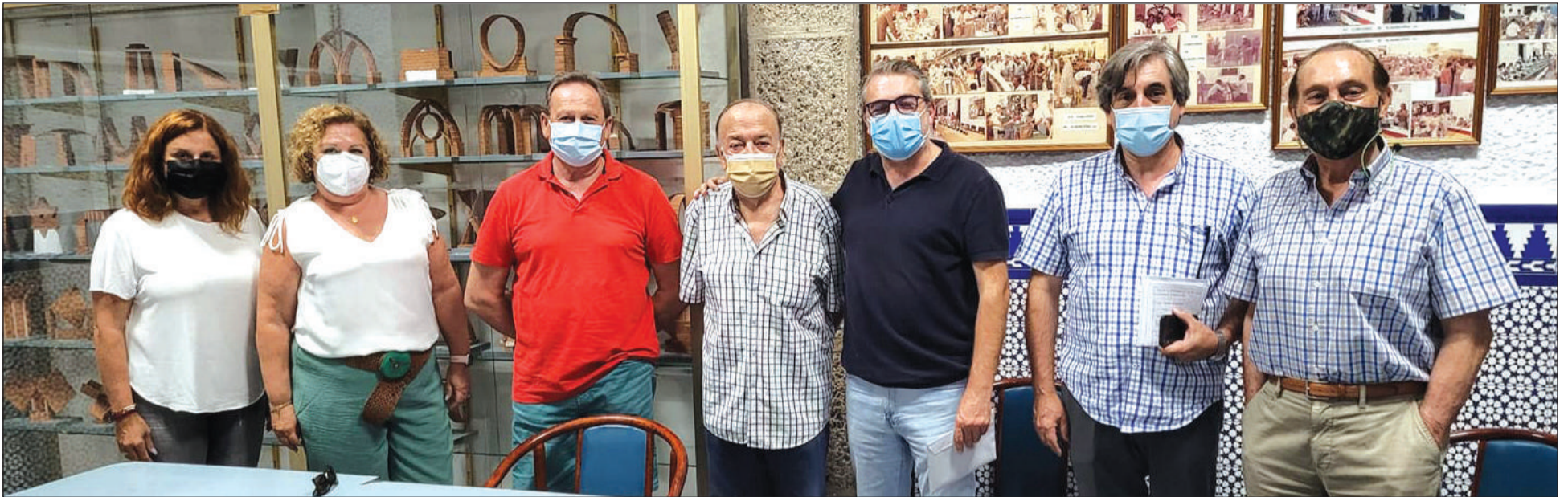
Reunión que mantenía la Comisión Organizadora del Concurso Nacional de Albañilería el pasado 9 de setiembre en l