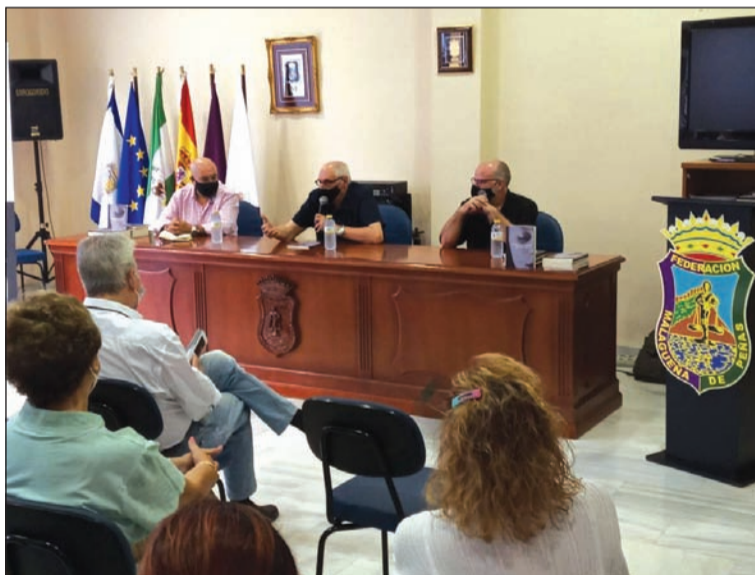
Presentación en la sede de la Federación.