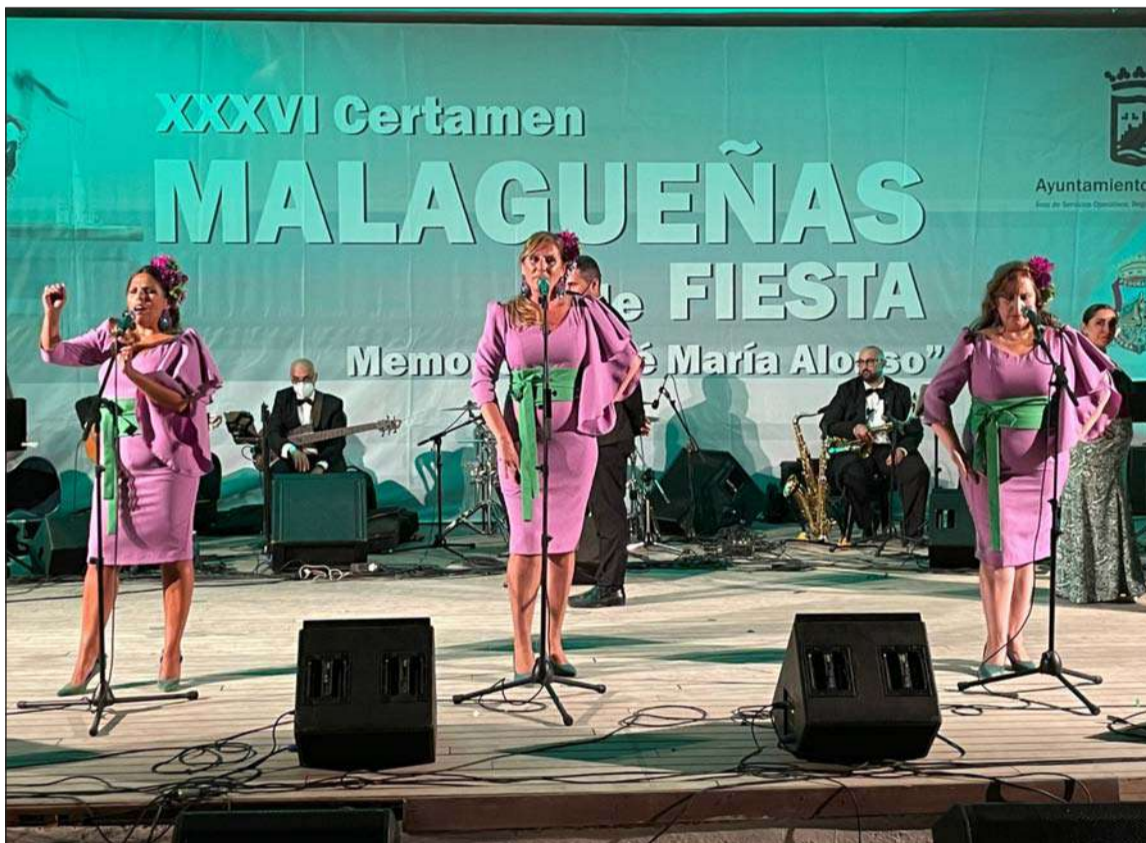
'Esencia y compás', grupo intérprete de la malagueña ganadora.