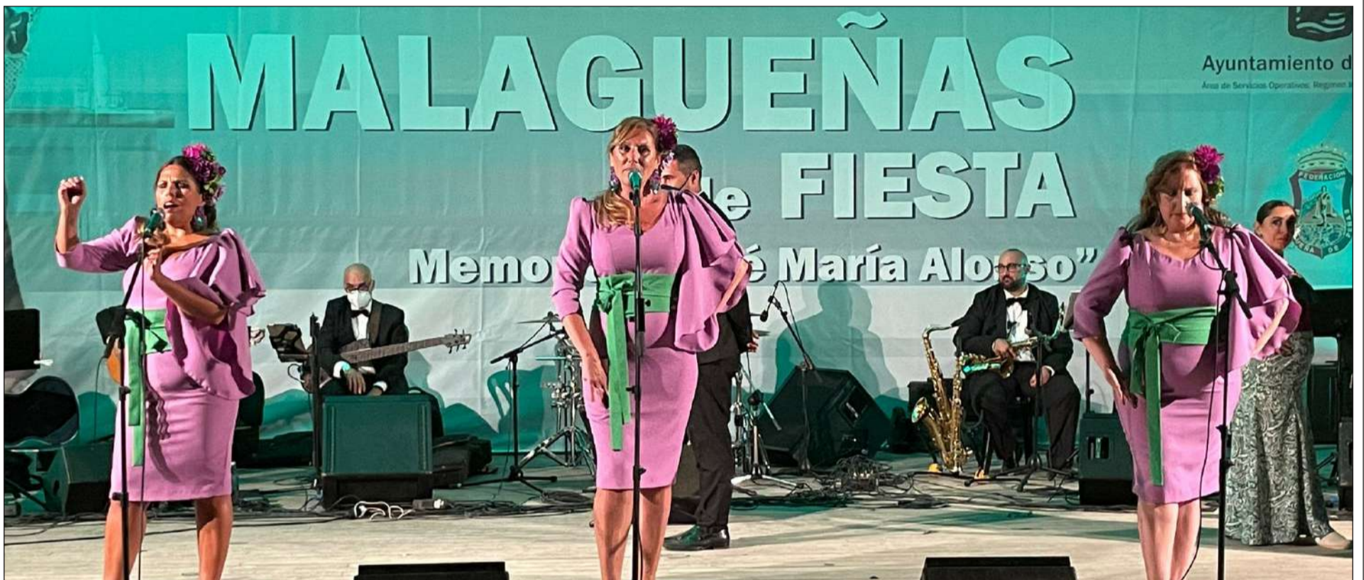
La composición de Miguel Moreno, interpretada por 'Esencia y compás', obtuvo el primer premio del Certamen de Malagueñas de Fiesta en su XXXVI edición, que celebraba su gran final el 17 de julio.

Número 730 28 de Julio de 2021 C/ Pedro Molina, 1 Tfno: 952 22 54 39 Fax: 952 21 48 82 E-mail: prensa@femape.com - fmpalcazaba@gmail.com Web: www.femape.com Edición digital: www.femape.com/laalcazabadigital Twitter: @FMPLaAlcazaba Facebook: www.facebook.com/FMPLaAlcazaba