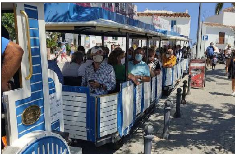
Recorrido en tren turístico por el municipio.