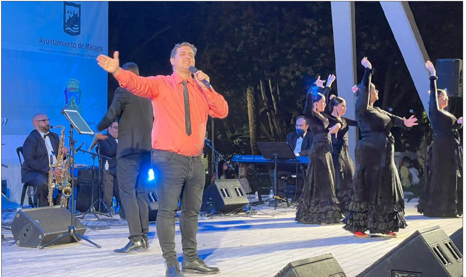
Los artistas malagueños han mostrado su arte en el Certamen de Malagueñas, y ahora podrán hacerlo en este circuito que recorrerá las sedes de distintas entidades federadas.