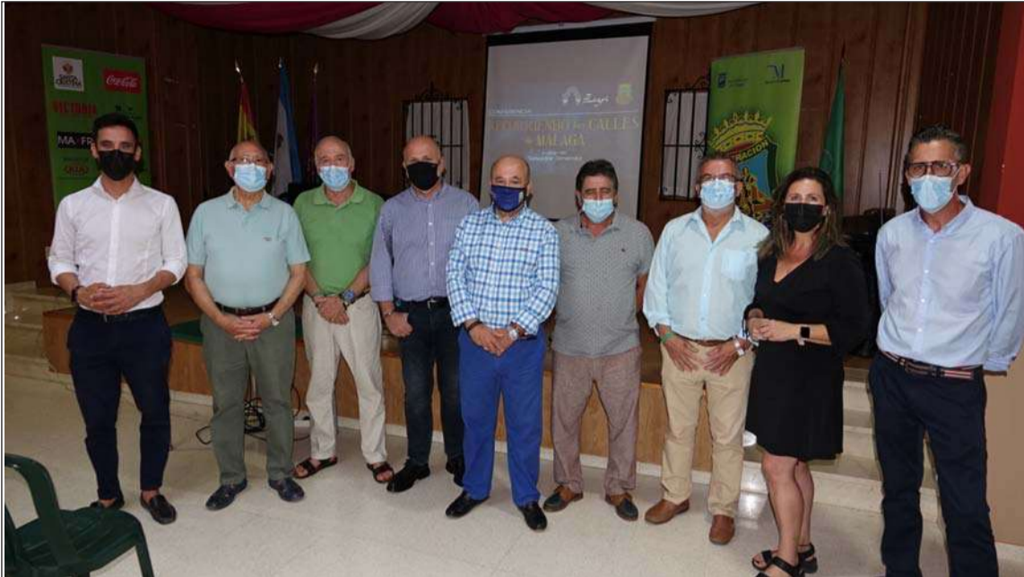
Asistentes a esta primera conferencia celebrada en la sede de la Peña Santa Cristina.