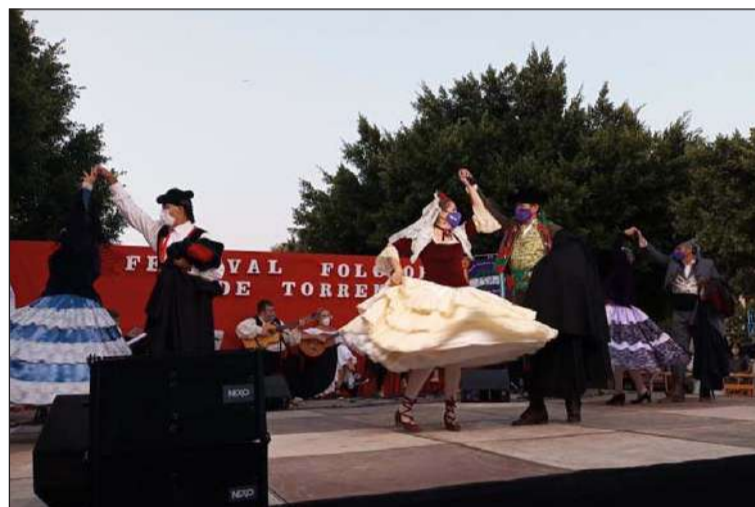
Uno de los grupos participantes.