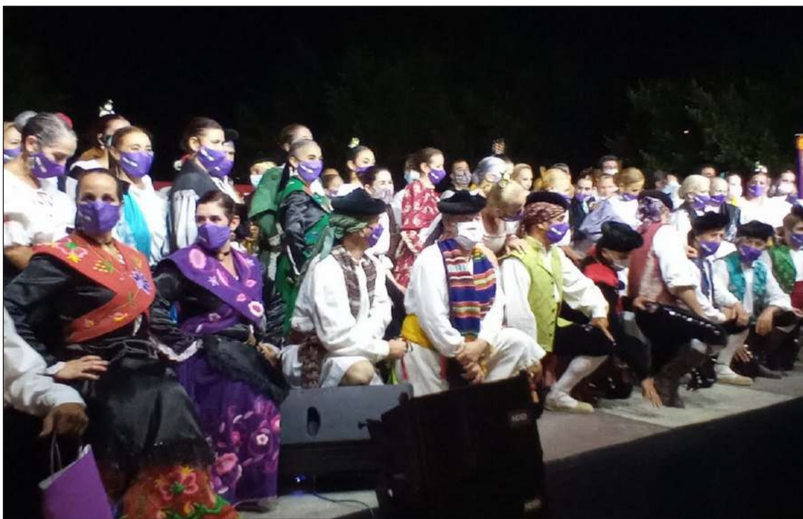
Componentes de los grupos participantes en el festival organizado por la Asociación Folclórico Cultural Juan Navarro.