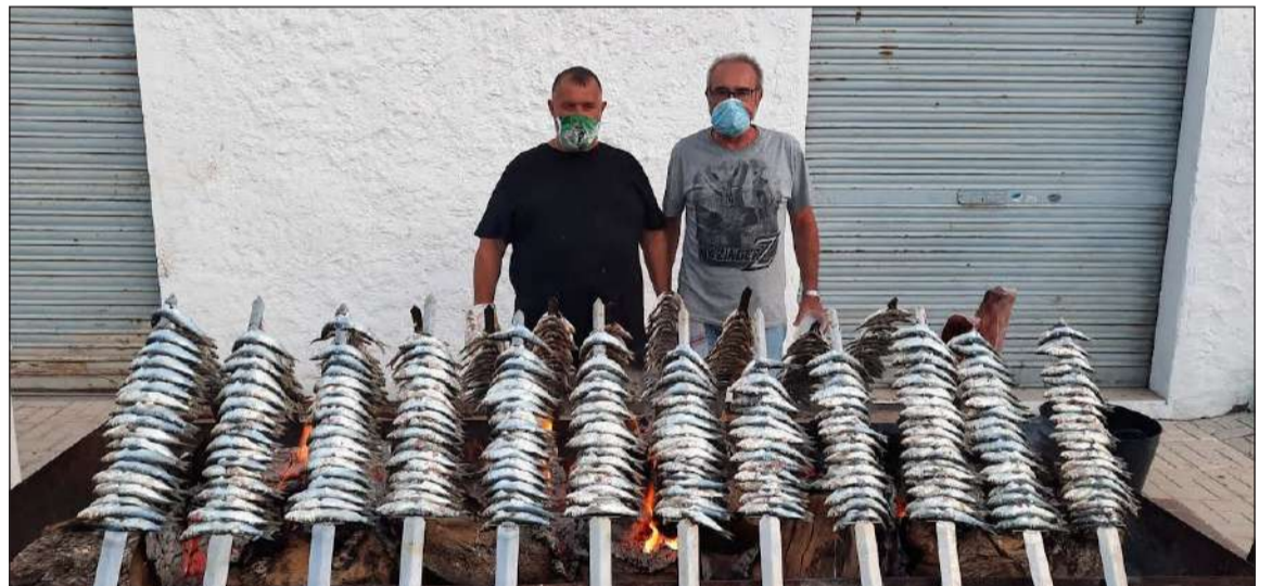
Encargados de preparar los espetos.

Se habilitaron mesas y sillas para que todo el mundo ocupara su lugar asignado, cumpliendo todas las medidas sanitarias vigentes en el momento de la celebración de esta actividad hace dos semanas.