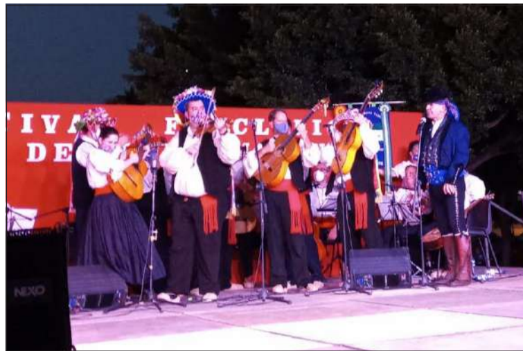
Verdiales en el Festival de Torremolinos.