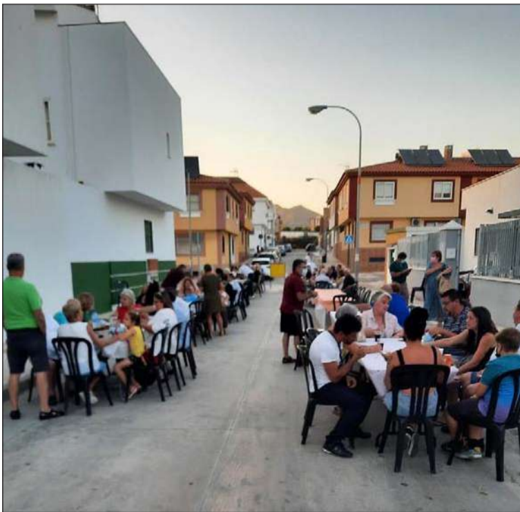
Socios en el exterior de la peña.