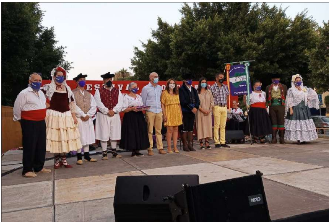
Acto celebrado en el Bulevar Marifé de Triana de Torremolinos.

Desde la organización se realizó un gran esfuerzo para cumplir con todas las medidas sanitarias necesarias para su correcto desarrollo.