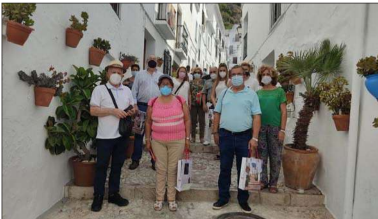
Peñistas en las pintorescas calles de Frigiliana.