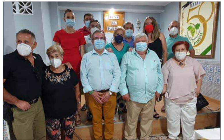
Asistentes a la actividad.

Además, se contaba con una actividad musical facilitada desde la propia Federación.