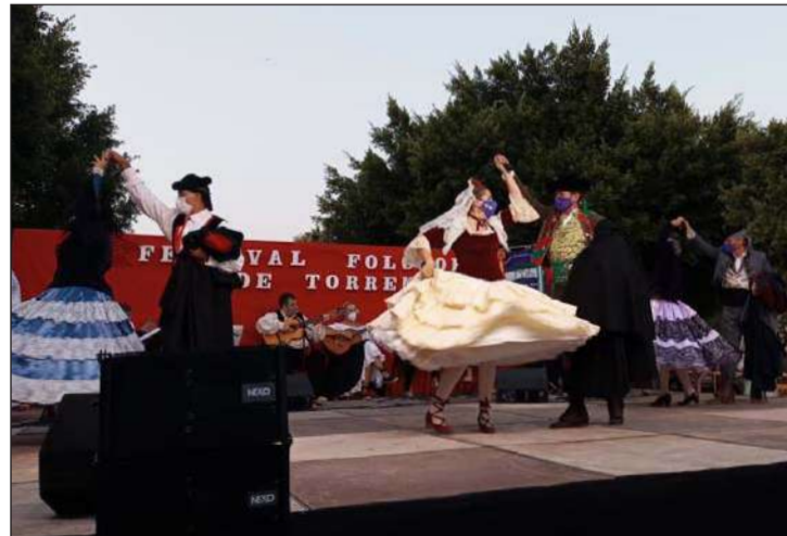
Uno de los grupos participantes en este festival.

La Asociación Folclórico Cultural ‘Juan Navarro’ ha realizado un gran esfuerzo para poder cumplir con la décima edición del Festival Folclórico de Torremolinos, celebrado el pasado sábado 24 de julio. Componentes actuales y de otras épocas se reencontraron en unas emotivas actuaciones en el Bulevar Marifé de Triana. También intervino la Panda de Verdiales de La Joya.