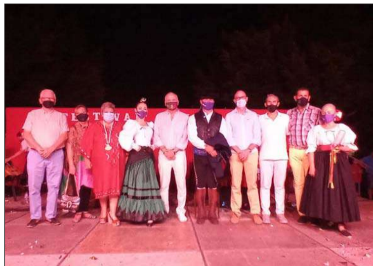
Asistentes e invitados a esta actividad cultural.