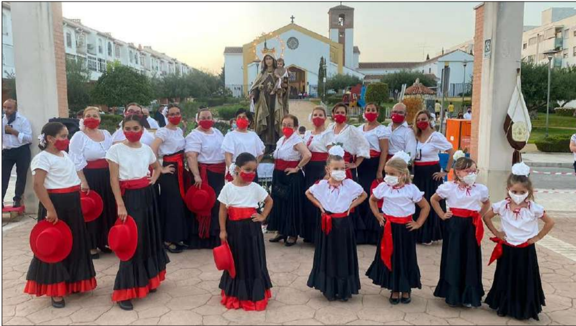
Grupos de baile de la asociación ante la Virgen del Carmen de la Colonia Santa Inés.