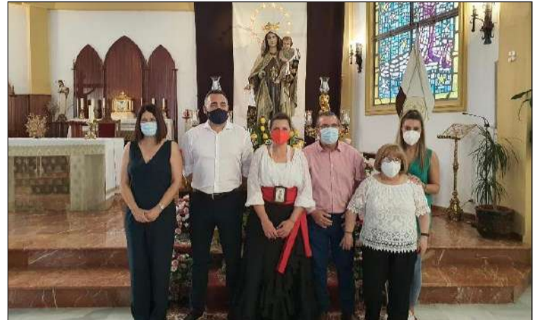
Integrantes de la entidad ante la Virgen.

Por otra parte, desde esta entidad perteneciente a la Federación Malagueña de Peñas, Centros Culturales y Casas Regionales 'La Alcazaba' se colaboraba en un 'flashmove' de tangos de la Repompa promovido por la Escuela de Flamenco de Andalucía.