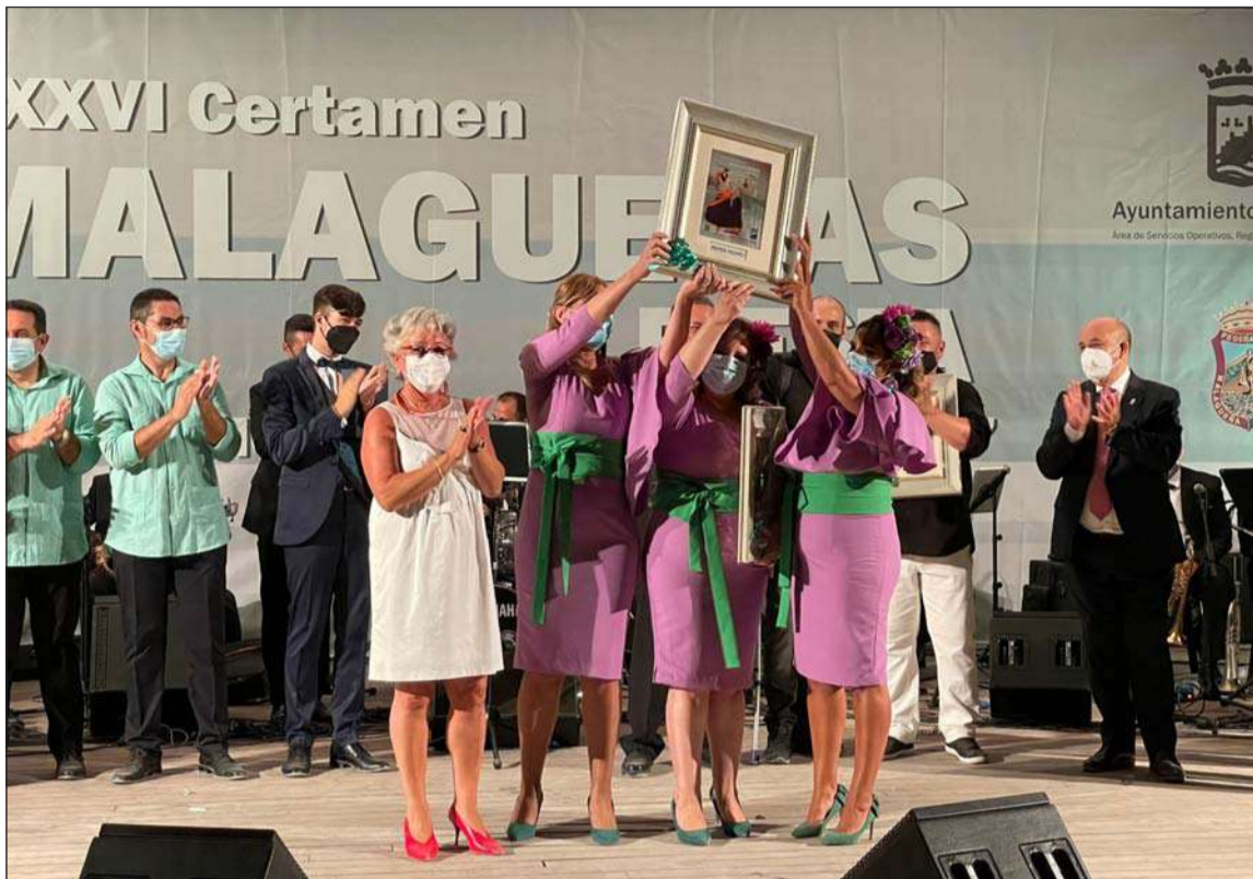
Entrega del primer premio.