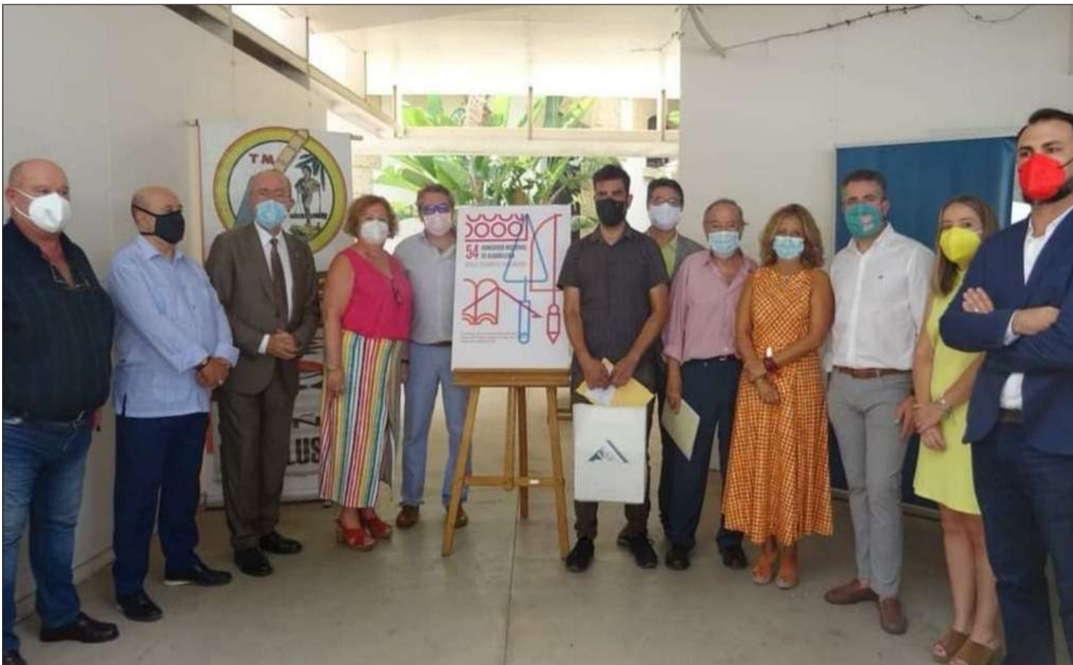
Asistentes a este acto de presentación del cartel, presidido por el alcalde Francisco de la Torre.