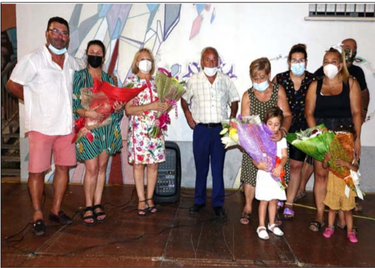
Acto de entrega de recuerdos y agradecimientos.