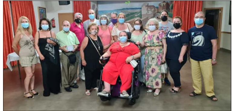
Grupo de alumnos de la Escuela de Copla.