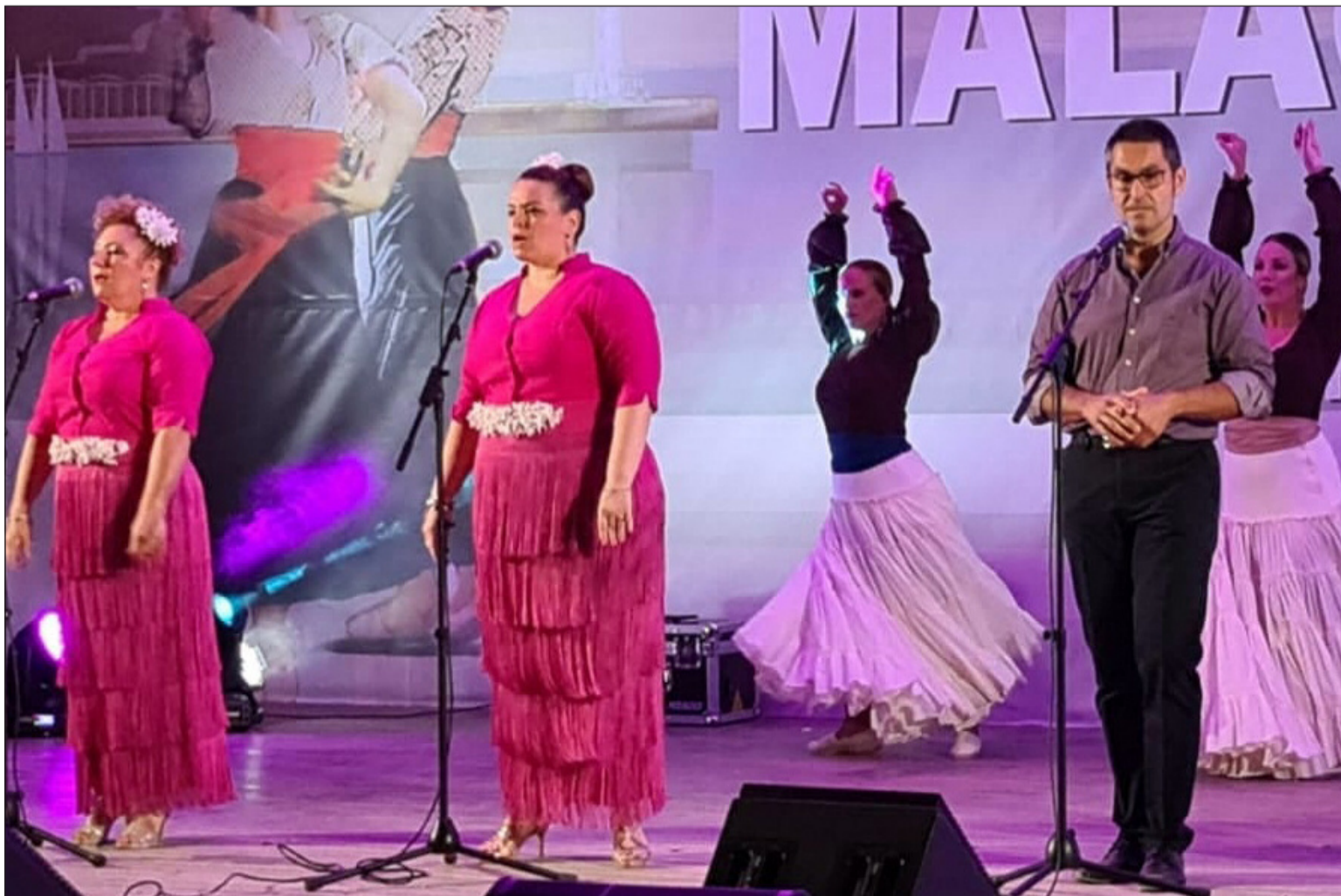
Uno de los grupos participantes, con el acompañamiento de grupos de baile.