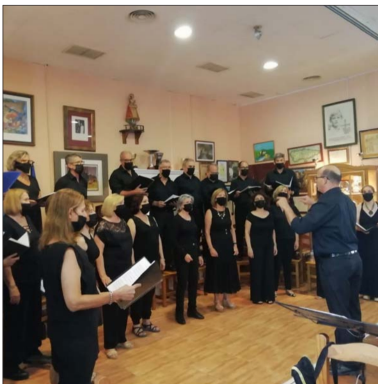
Actuación de la Coral en el Centro Asturiano.