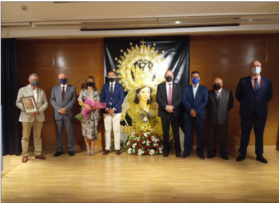
Imagen del acto celebrado en la sede de la ONCE.