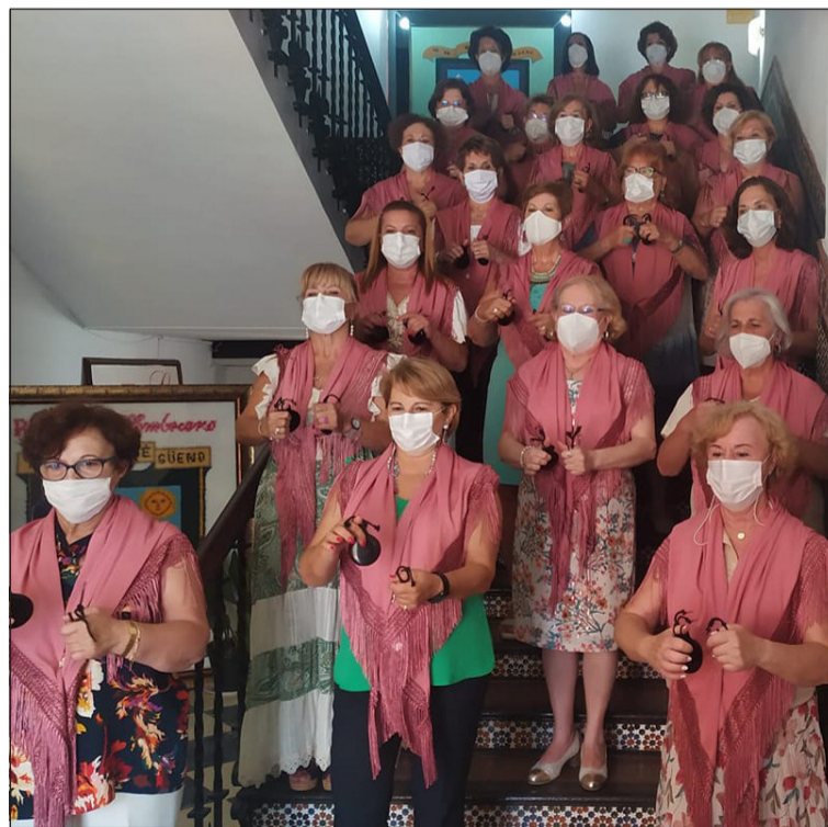
Clausura del Curso de Castañuelas.

En cuanto a actuaciones, se contaba con una exhibición como fin de curso del taller de Castañuelas; mientras que para el próximo sábado 17 se anuncia la divertida comedia teatral 'La Princesa Aldara y la Corte del Rey Alvar' en la sede de la entidad.