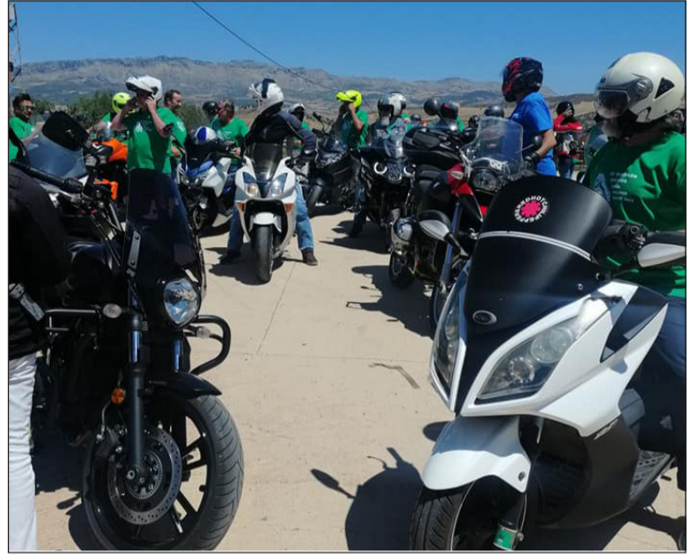
Ruta Motera desde la Peña Colonia Santa Inés.

Además, la entidad participa en los actos en honor a la Virgen del Carmen en su barriada.