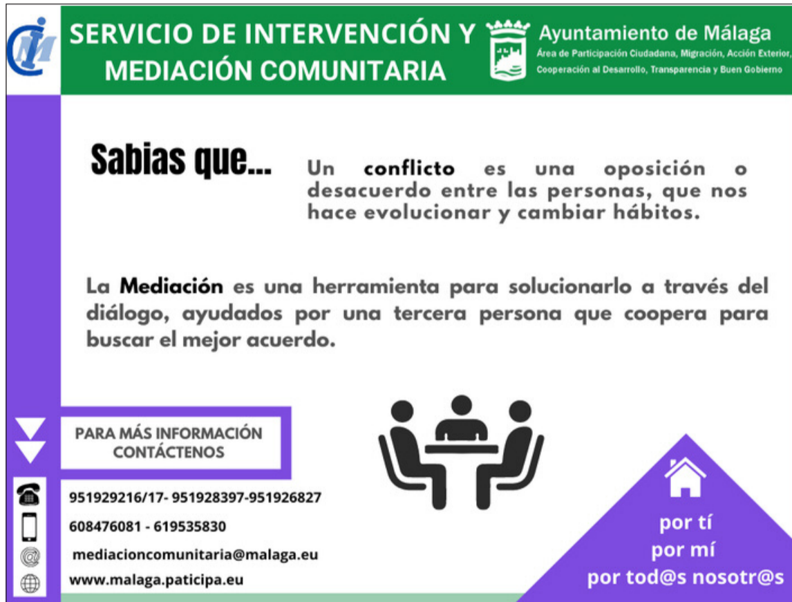
Información del programa.

Entidades colaboradoras con esta publicación: