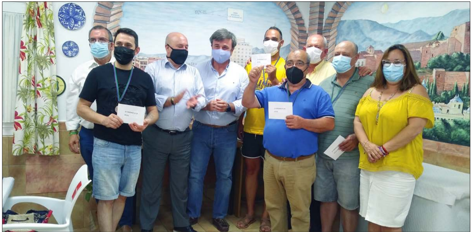
Premiados, directivos de la entidad e invitados a la entrega de premios.