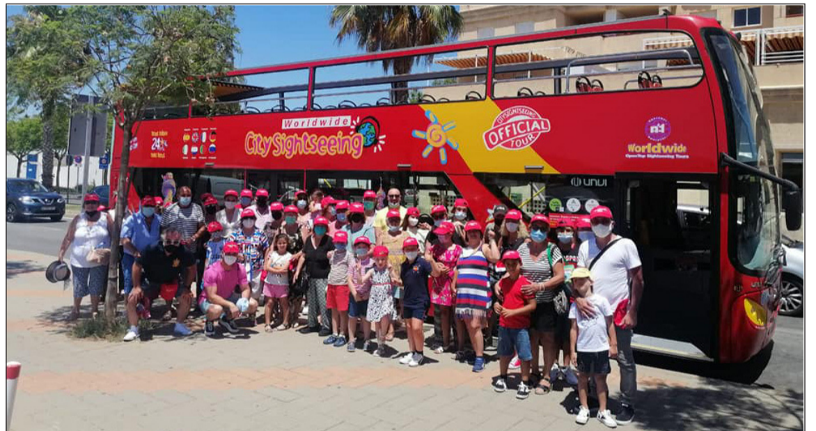
Ruta turística por Málaga y su bahía.