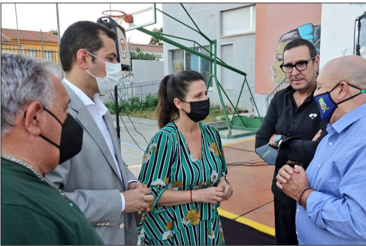
Instantes antes de comenzar la actividad.