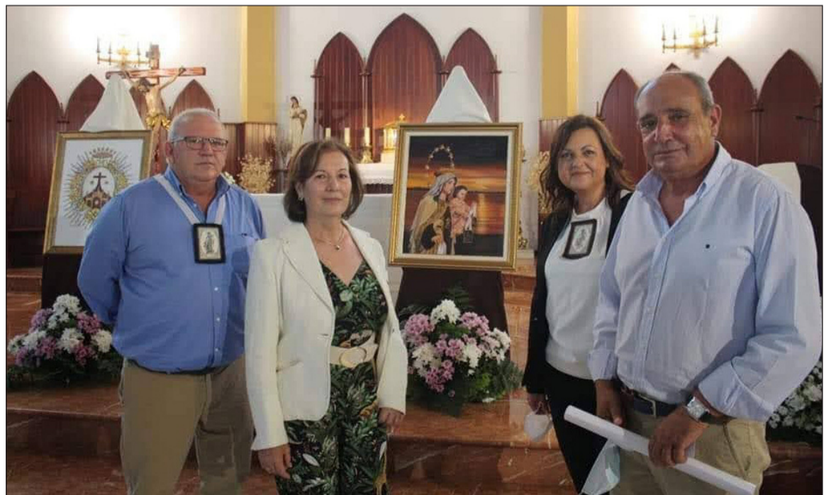
Representación de la entidad en la presentación del cartel de la Virgen del Carmen.