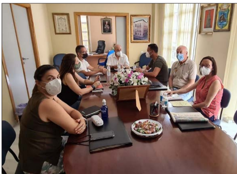
Un instante de la reunión.