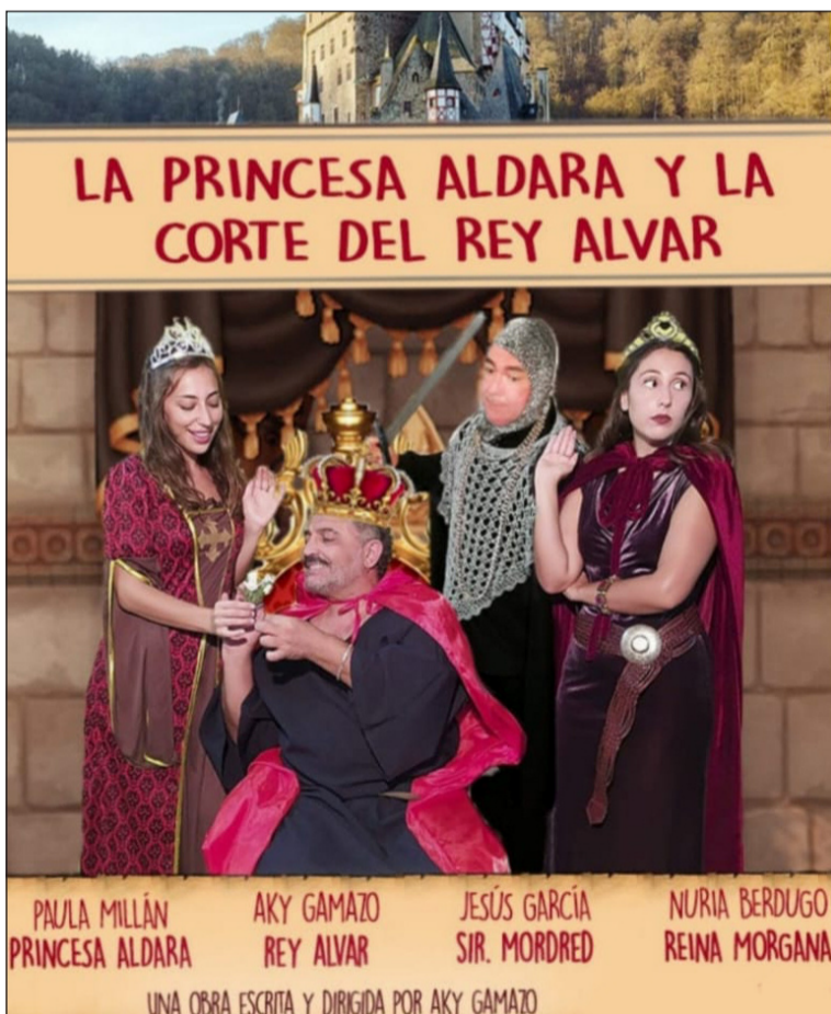
Cartel de la representación teatral.