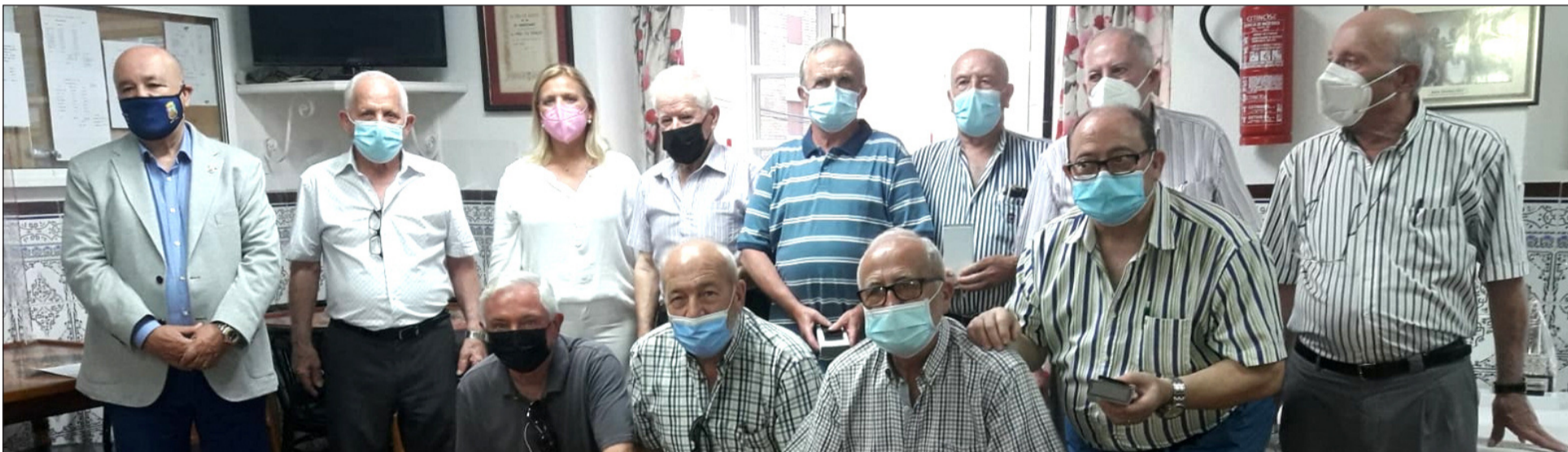
Acto de entrega de trofeos.