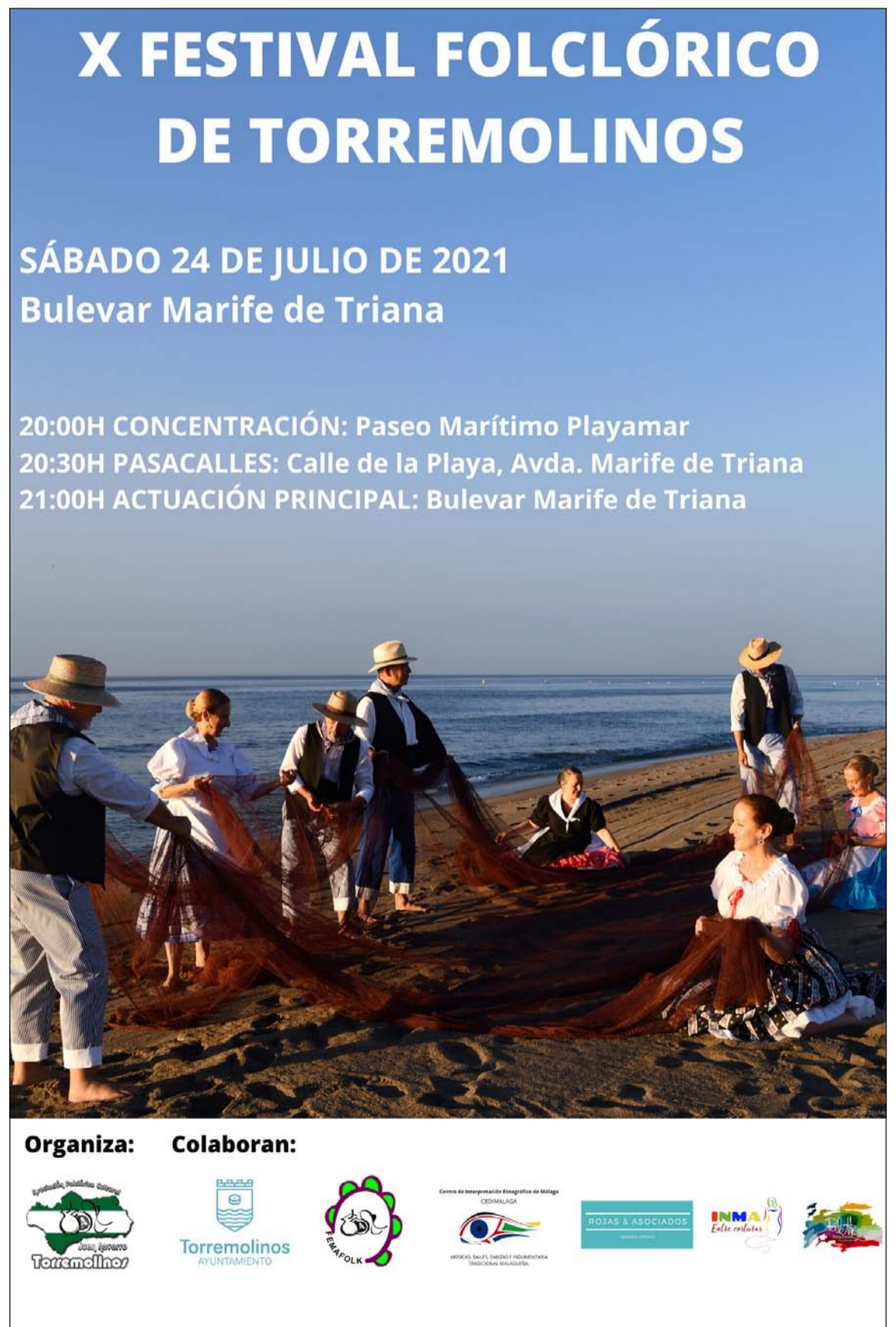
Cartel del festival.

En este sentido, se invita a preguntar sus servicios, tanto para la Lotería Nacional, como para cualquier otro sorteo.