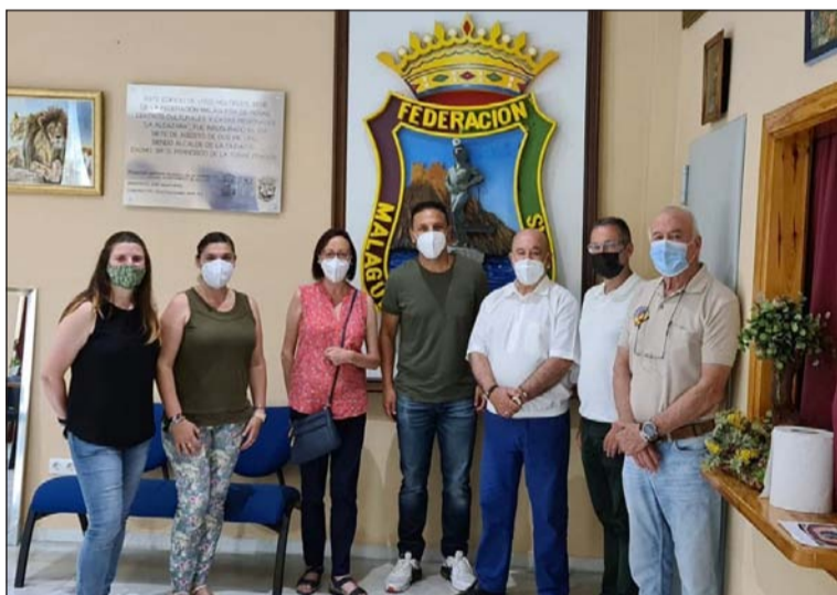
Equipo de Participación Ciudadana, con representantes de la Federación.