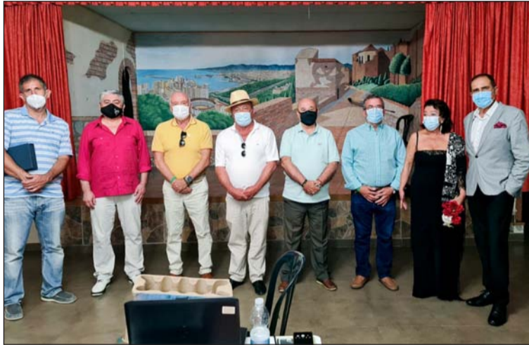
Participantes en el acto y representantes de la Federación.