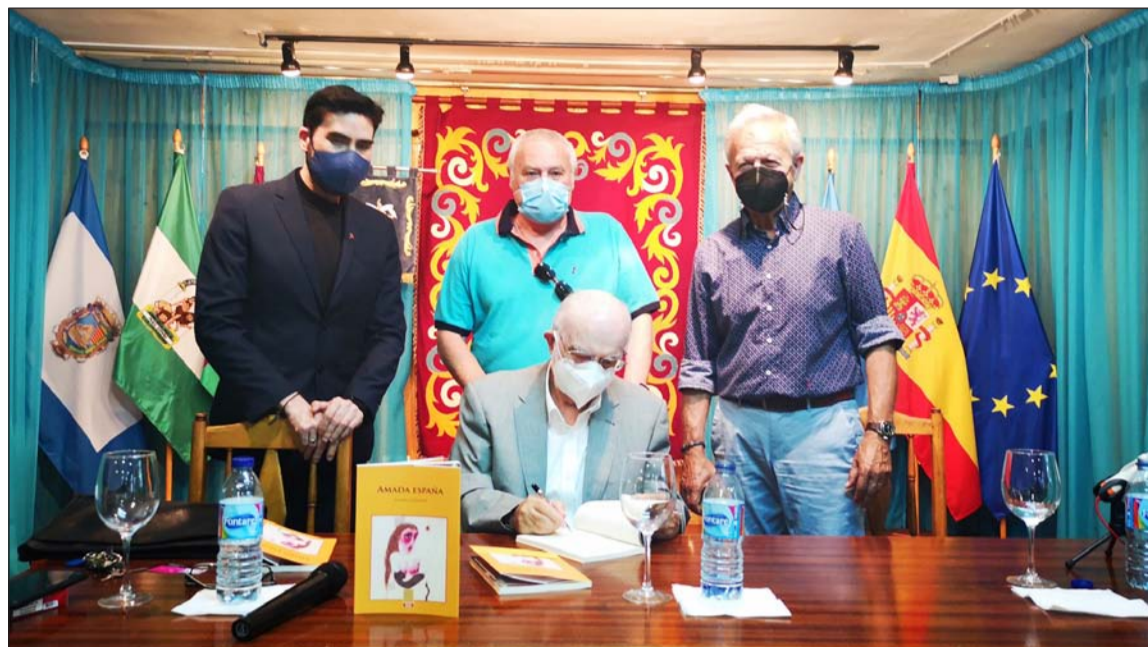
Participantes en la presentación.

Finalizó el acto con la intervención del autor, que agradeció en primer lugar a la Casa de Melilla, de la que también es socio, que siempre esté disponible para este tipo de eventos, leyendo varios de los poemas del libro.