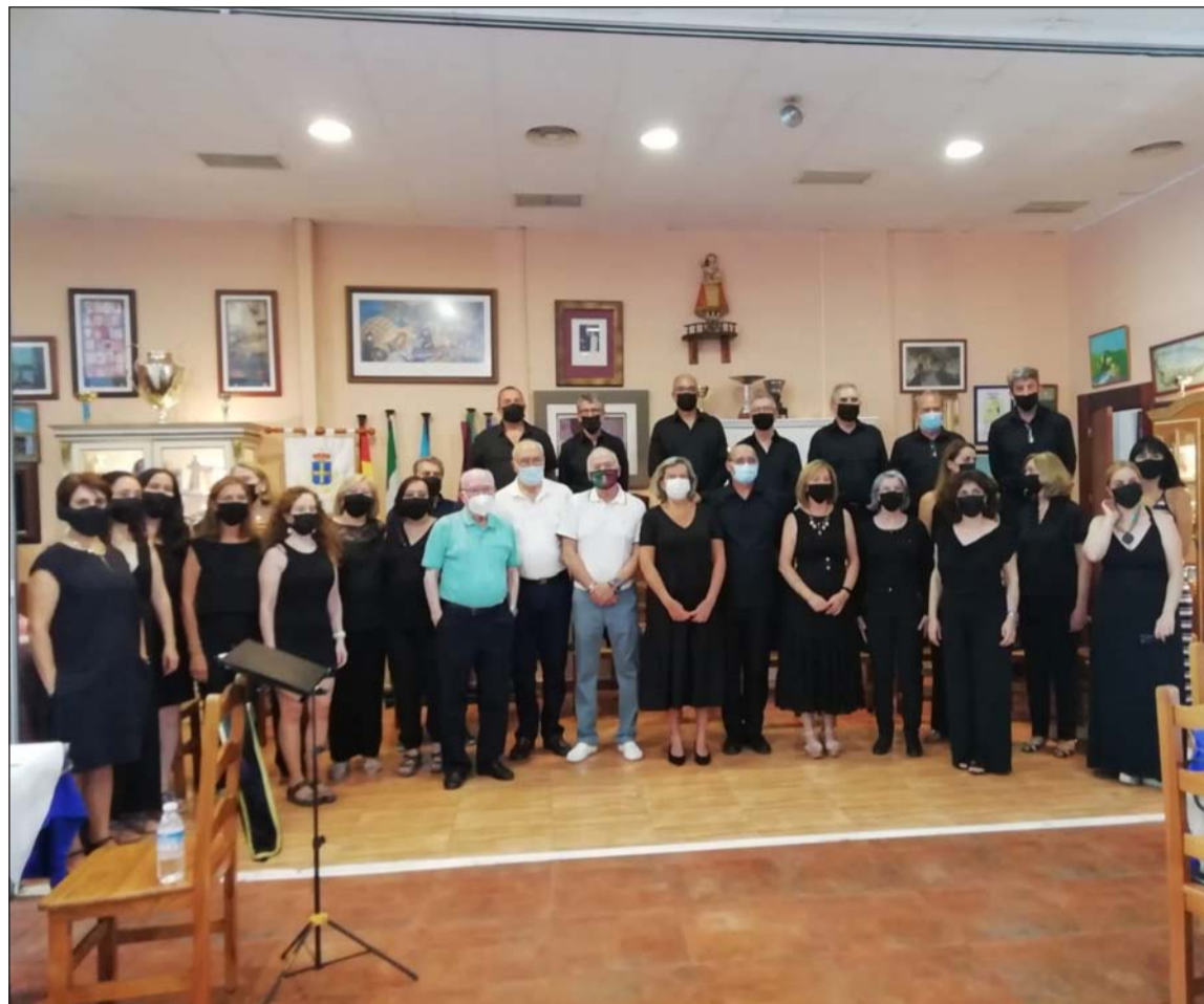
Miembros de la coral y del Centro Asturiano de Málaga, en su sede de Torremolinos.